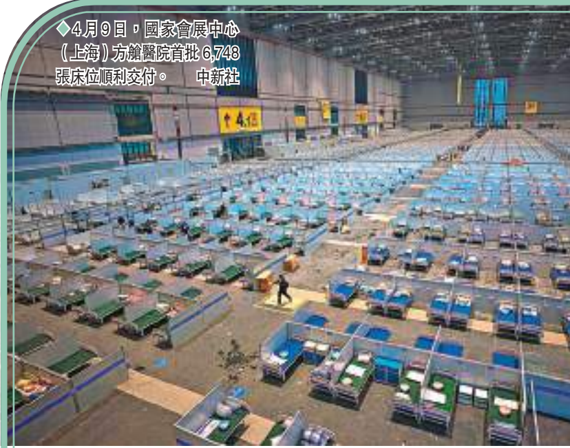
4月9日，國家會展中心(上海)方艙醫院首批6,748張床位順利交付。