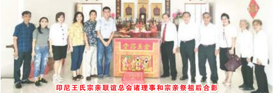
印尼王氏宗亲联谊总会诸理事和宗亲祭祖后合影