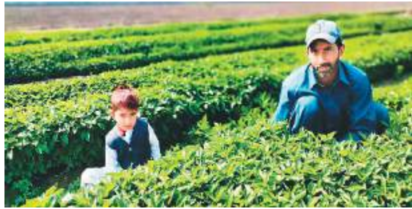
一位巴基斯坦农户带着孩子在辣椒田间工作。