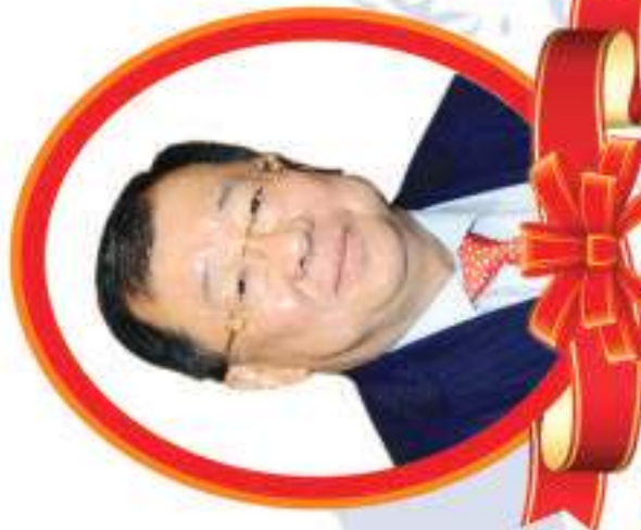
本會常務副總主席