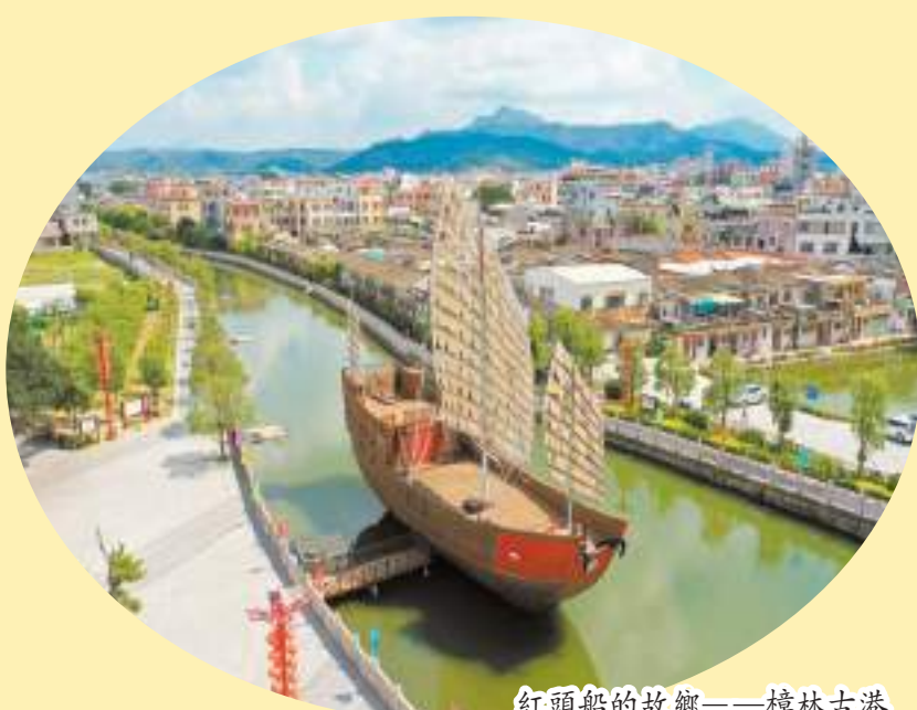
紅頭船的故鄉——樟林古港

牢記囑托，感恩奮進，小公園開埠區的“僑”字文章在深化在拓展。近年來，汕頭市積極推進小公園開埠區保育活化工作，圍繞中山紀念亭等核心地標，有機融合了非遺展示、非遺文創活化、美食體驗、紅色教育等主題元素，打造“民俗特色文化”經濟圈，并通過“戲亭印象”等文化惠民活動，逐步樹立起小公園的經濟文化品牌，豐富了汕頭市民和游客的精神生活及消費業態，讓汕頭老城區煥發新活