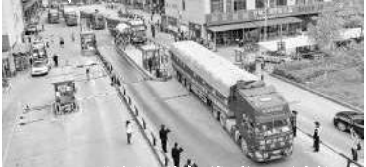
4月9日，装有蔬菜的车队从襄阳出发前往上海(无人机照片)。为支援上海抗击疫情，湖北省襄阳市采购蔬菜，经分拣、打包后，从襄阳发往上海。