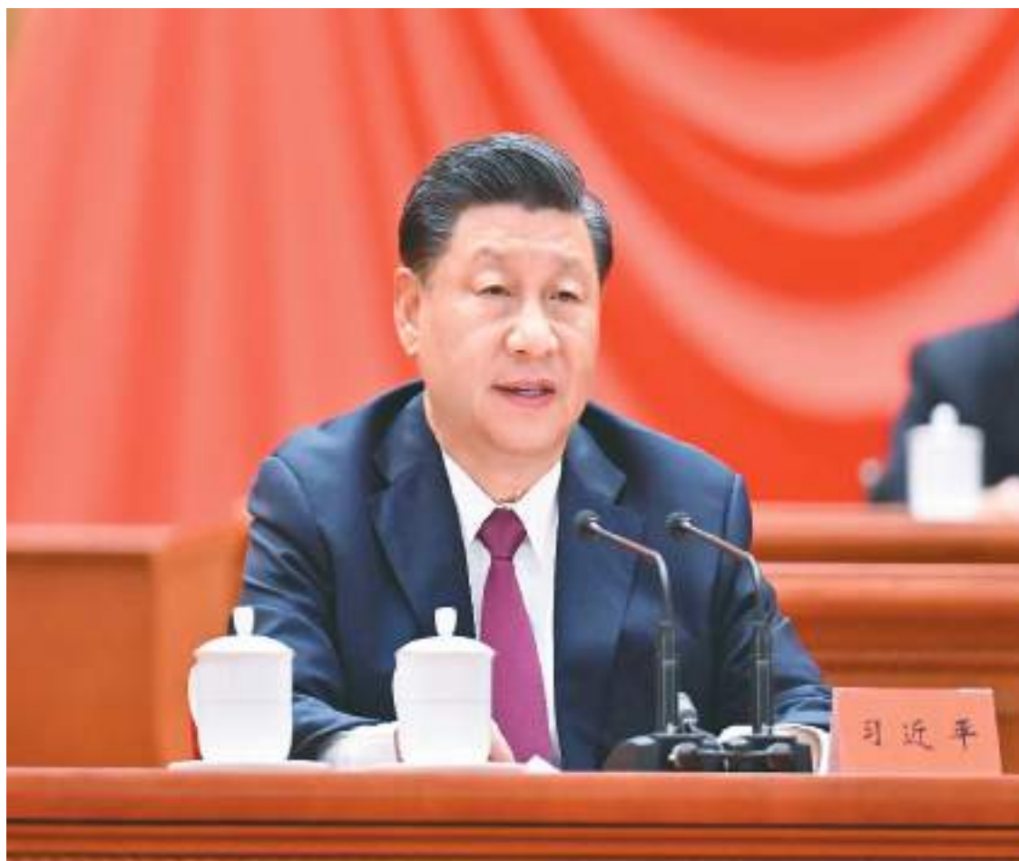
4月8日,北京冬奥会、冬残奥会总结表彰大会在北京人民大会堂隆重举行。中共中央总书记、国家主席、中央军委主席习近平在大会上发表重要讲话。