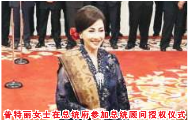
普特丽女士在总统府参加总统顾问授权仪式