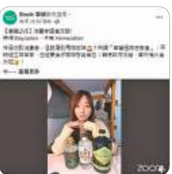
◆掌舖會邀請商戶做直播，提高顧客的購物意慾。