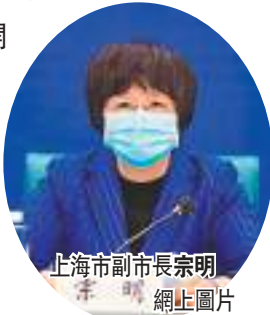
上海市副市長宗明。

15萬例。結合此前多輪篩查的情況，上海已於9日起再次開展一次全員核酸檢測，並將根據檢測結果分析研判，實施分區分級差異化防控，依據風險程度的大小，按照「三區劃分」原則，進行階梯式管理。上海市副市長、市疫情防控工作領導小組副組長宗明9日在上海市政府新聞發布會上表示，「很多工作我們做得還很不夠，離大家的期望還有很大的差距，我們一定盡全力改進。」