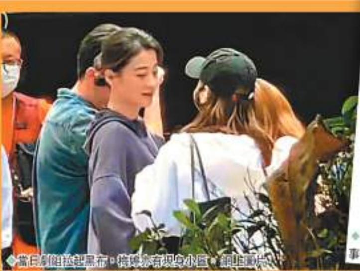
◆當日劇組拉黑布,據曝亦有現身小區。網上圖片

香港文匯報訊(記者 文芬、達里)近日上海疫情持續嚴峻,居留在上海的藝人除了接受檢疫,亦自覺在家,避免群聚,而早前深圳亦出現疫情,並進行了全民檢測,遏制疫情擴散。不過近日內地著名藝人黃渤因拍攝電視劇,進入到深圳一個社區取景,卻因為防疫問題被住戶投訴,劇組被迫離開。在事後劇組作出回應及道歉,承認與居民溝通不足。