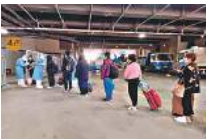
首批患者進館。網上圖片