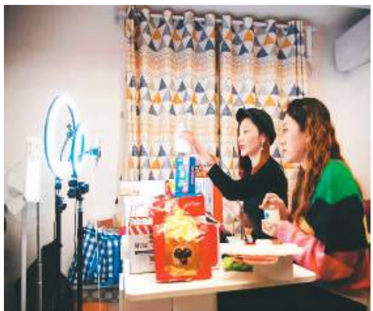
图为澳门主播在直播时展示产品。

前不久，一场集思会汇聚了澳门最活跃的直播电商运营者、参与者、支持者和研究者，大家达成的共识是：必须立足粤澳深度合作区这块热土，建厂、建仓、建配送体系，用物流带动人流、资金流，将制度优势、税收优惠等整合进电商产品链条，才能用好电商平台，更好地融入国家发展大局。（本报澳门电）