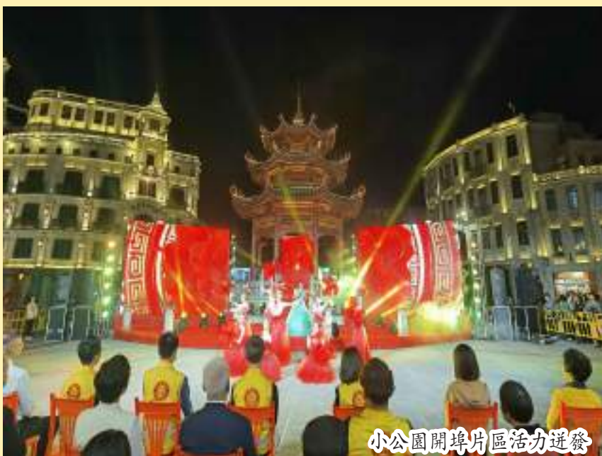
小公園開埠區活力迸發

百載商埠，春華正茂。往昔，潮汕先輩乘坐紅頭船漂洋過海艱苦創業；乘着改革開放的東風，情系桑梓的海內外潮人投身家鄉建設。進入新時代，總書記的殷殷囑托和深情期望，激勵着每一位潮人，因僑而立、因僑而興的汕頭經濟特區開啓了新的春天。