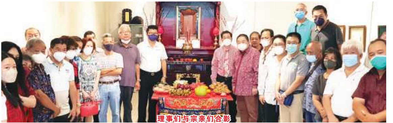
理事们与宗亲们合影