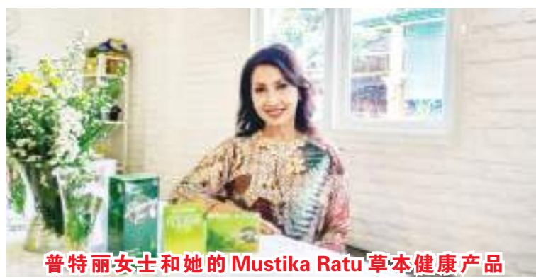
普特丽女士和她的Mustika Ratu草本健康产品

立和融资,及大力推广电子商务来鼓励和发展此方面的变革,同时加强印尼文化多样性的统一。此组织目前拥有近17000的会员,经常进行线上和线下活动分享创业的经验,也无形助长了情谊,共同携手反对性虐待及任何歧视女性的行为等。此外,我们的“印尼小姐组织”(Yayasan Puteri Indonesia)下的“环球小姐”、“国际小