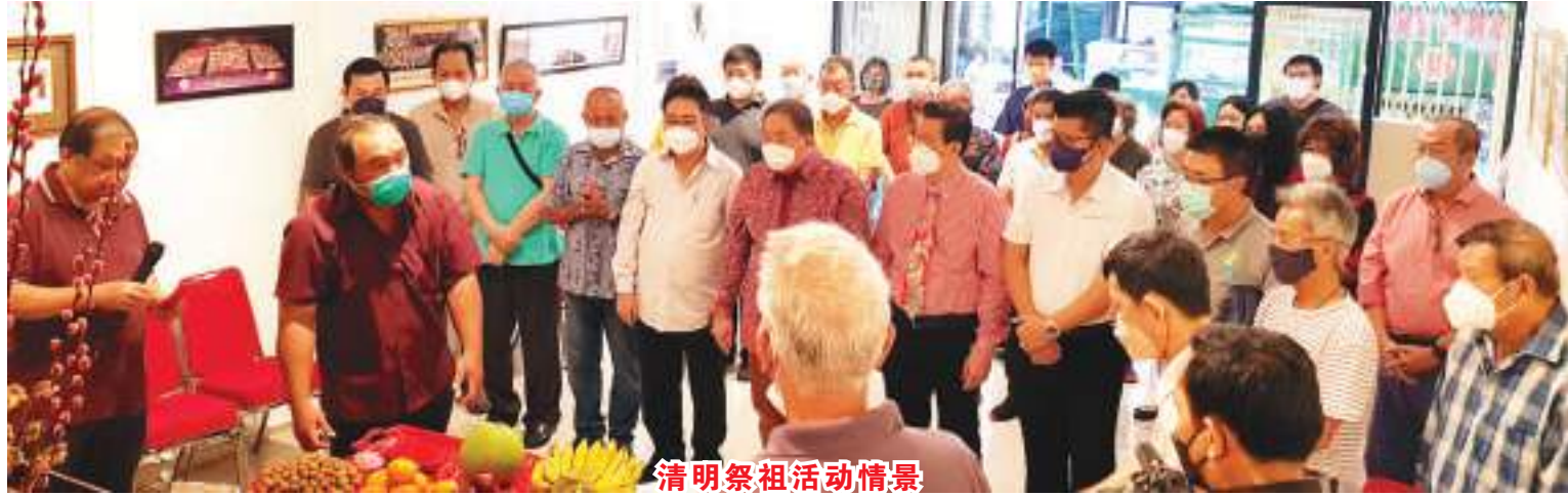
清明祭祖活动情景