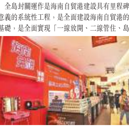
海南自貿港2025年前適時啟動全島封關運作。早前消費者在海口免稅店選購商品。

香港文匯報訊 據新華社報道，記者9日從海南省委深改辦(自貿港工委辦)了解到，根據海南自貿港全島封關運作準備工作相關安排，為減少封關前後壓力落差，避免封關後出現重大風險，海南將爭取80%以上的自貿港政策在封關前充分測試、落地實施。