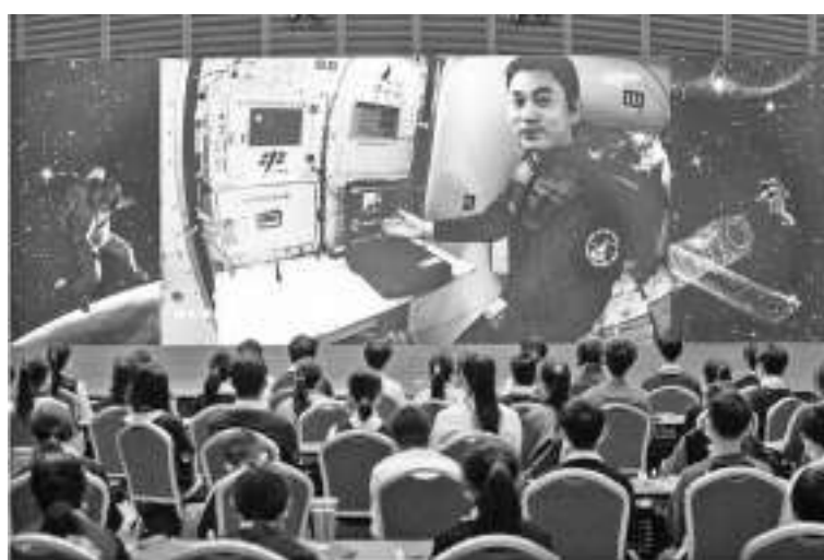
2021年12月9日，“天宫课堂”第一课开课，神舟十三号乘组航天员翟志刚、王亚平、叶光富在空间站进行太空授课。

新华社华盛顿4月10日电 中国驻美国大使馆9日举办“天宫问答——神舟十三号航天员乘组与美国青少年问答”活动，近500名美国中小学生对航天员翟志刚、王亚平、叶光富