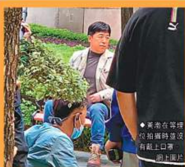
◆黃渤在等埋位拍戲時並沒有戴上口罩。

香港文匯報訊(記者 文芬、達里)近日上海疫情持續嚴峻,居留在上海的藝人除了接受檢疫,亦自覺在家,避免群聚,而早前深圳亦出現疫情,並進行了全民檢測,遏制疫情擴散。不過近日內地著名藝人黃渤因拍攝電視劇,進入到深圳一個社區取景,卻因為防疫問題被住戶投訴,劇組被迫離開。在事後劇組作出回應及道歉,承認與居民溝通不足。