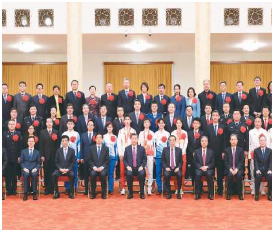
4月8日,北京冬奥会、冬残奥会总结表彰大会在北京人民大会堂隆重举行。会前,习近平等会见北京冬奥会、冬残奥会突出贡献集体代表、突出贡献个人和中国体育代表团成员,并同大家合影留念。

新华社北京4月8日电 北京冬奥会、冬残奥会总结表彰大会8日上午在人民大会堂隆重举行。中共中央总书记、国家主席、中央军委主席习近平出席大会并发表重要讲话。(讲话全文见第二版)习近平强调,伟大的事业孕育伟大的精神,伟大的精神推进伟大的事业。北京冬奥会、冬残奥会广大参与者珍惜伟大时代赋予的机遇,在冬奥申办、筹办、举办的过程中,共同创造了北京冬奥精神。北京冬奥精神就是胸怀大局、自信开放、迎难而上、追求卓越、共创未来。我们要大力弘扬北京冬奥精神,以更加坚定的自信、更加坚决的勇气,向着实现第二个百年奋斗目标奋勇前进,向着实现中华民族伟大复兴的中国梦奋勇前进。