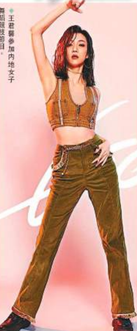
◆王君馨參加內地女子舞蹈競技節目。

黃渤與梅婷近日合作主演由林柯執導的內地電視劇《打開生活的正確方式》,正如如火如荼地趕拍當中,劇組日前前往位於深圳的社區取景拍攝時,卻遇到小區居民投訴。據悉,當時劇組約有30人進入社區,有部分人員沒戴口罩,居民擔心群聚有染疫風險,黃渤與劇組在社區拍攝約半天時間,便被迫離開。