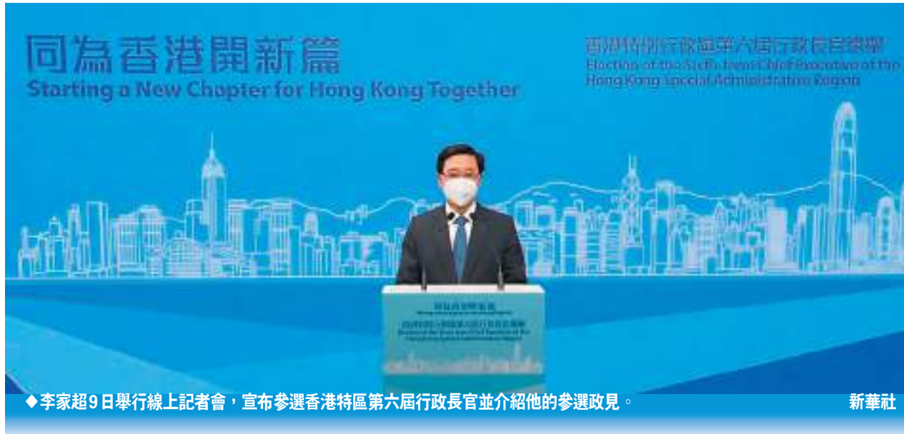
李家超9日舉行線上記者會，宣布參選香港特區第六屆行政長官並介紹他的參選政見。

早前公開稱會報名參加新一屆行政長官選舉的還有沈國林、胡世全、賴紅梅、李稚嘉、蕭德良及李璧而。