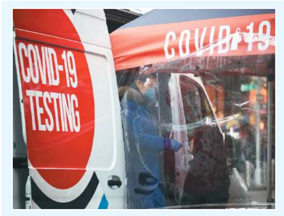
近日，一名男子在美国纽约一个新冠病毒检测点接受检测。