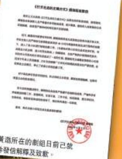
◆黃渤所在的劇組日前已就事件發信解釋及致歉。