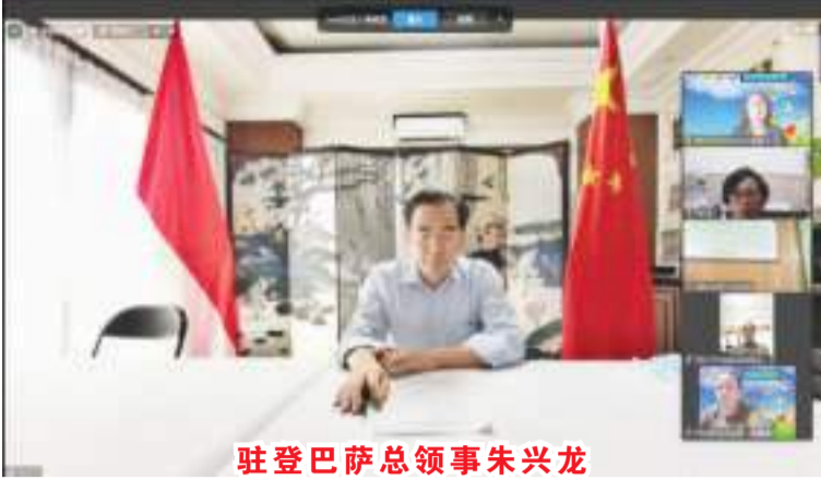
驻登巴萨总领事朱兴龙