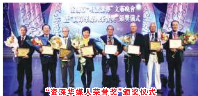
“资深华媒人荣誉奖”颁奖仪式