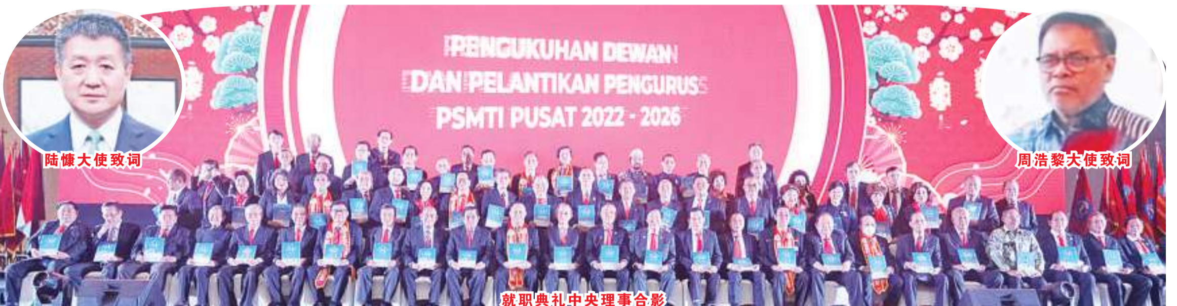
就职典礼中央理事合影

【本报讯】2022年7月6日(星期三)上午9时,印华百家姓协会(PSMTI)中央理监事(2022-2026年度)就职典礼在雅加达 Pondok Indah 的洲际酒店隆重举行。