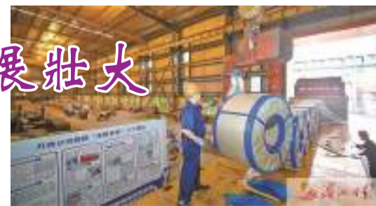
新萬鑫(福建)精密薄板有限公司生產的取向硅鋼帶，經過多道工序“打磨”變得細薄，廣泛應用於各領域。圖為工人正在打包成品出廠。