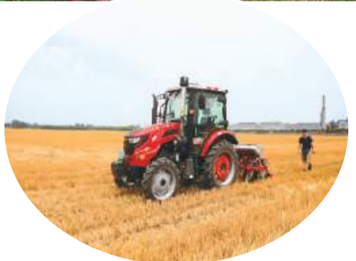
▲山东省东营市广饶县稻庄镇裕耕种植专业合作社500多亩高标准农田里，大型播种机械正在进行大豆玉米带状复合种植作业。