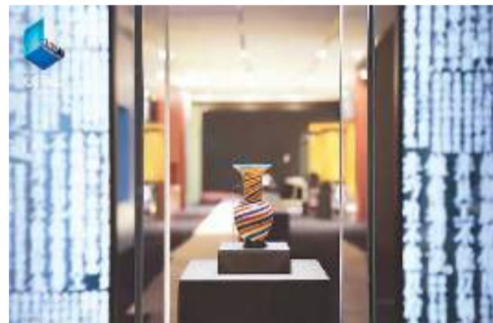
《见证香港故宫》剧照

背靠祖国、立足香港、放眼世界，这是香港故宫文化博物馆的独特优势和发展策略。记录历史方能展望未来。《见证香港故宫》将作为这个中国故事的影像见证，为国家、民族、时代留存珍贵的影像记忆。