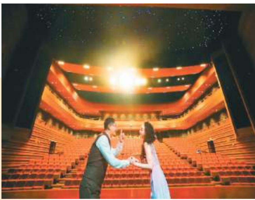
新落成的曹禺剧场排练。

两位老师一起演戏，发现他们手里永远都会拿着一个本子。于是之老师在没有排戏的时候，总是坐在角落，在自己的本子上一直不停地写，把自己对于人物的理解与表演的感受不停地记录下来。而朱旭老师拿着的本子是自己抄录的“剧本”。他认为抄一遍剧本就等于背一遍，所以排练之前，会把剧本一笔画地抄在笔记本上，再将笔记带到排练厅，其他留白的地方则写满对人物的理解、内心潜台词以及一些临场的创作灵感。老一辈艺术家从来不以大师和明星自居，永远把自己作为一名演员，认真对待每一个角色。