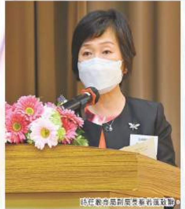
駐任教育局副局長蔡若蓮致辭。

【香港商報訊】齊色園主辦可藝中學於5月21日舉行三十周年校慶典禮，當日嘉賓雲集，氣氛熱鬧。校慶典禮主禮嘉賓包括時任教育局副局長蔡若蓮博士、齊色園主席馬澤華、齊色園副主席兼教育委員會主席陳煒輝、齊色園董事兼教育委員會副主席陳拾壹、齊色園教育委員會顧問陳志球及齊色園副主席兼可藝中學校監余君慶等出席，共同見證齊色園主辦可藝中學邁進30周年重要的里程碑。