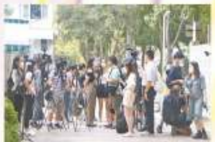
恢復全校全日面授課堂的學校，當天得到全港各大傳媒雲集校門，爭相採訪。