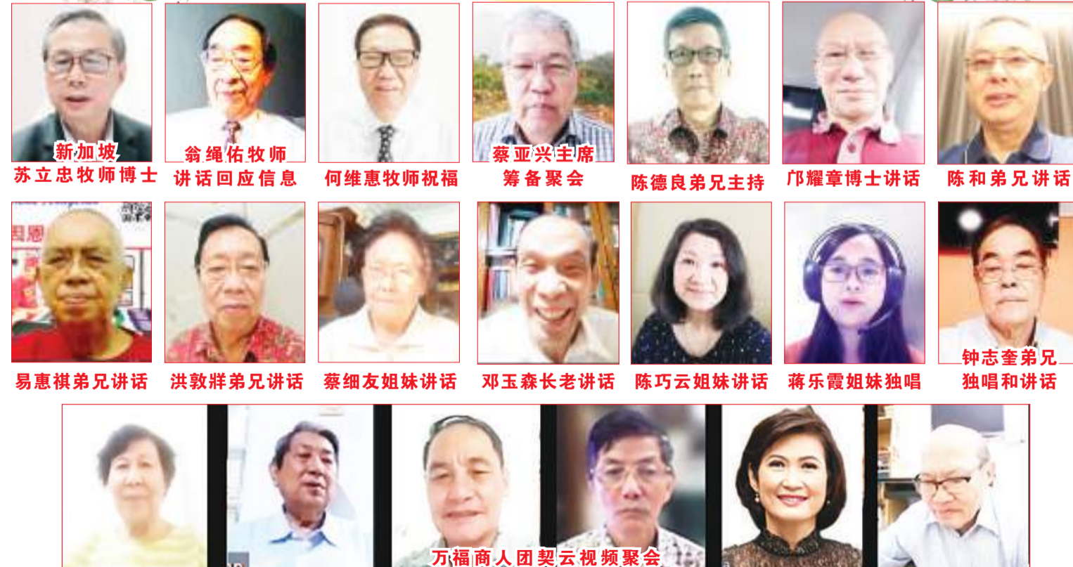
万福商人团契云视频聚会

积极方面的影响是：一家人有更多相处的时间；因为孩子在家时间更长而变得更快乐；父母在教育孩子时学了新技能；享受重新学习的乐趣。而消极方面的影响是：工作方面没能全力以赴；需要