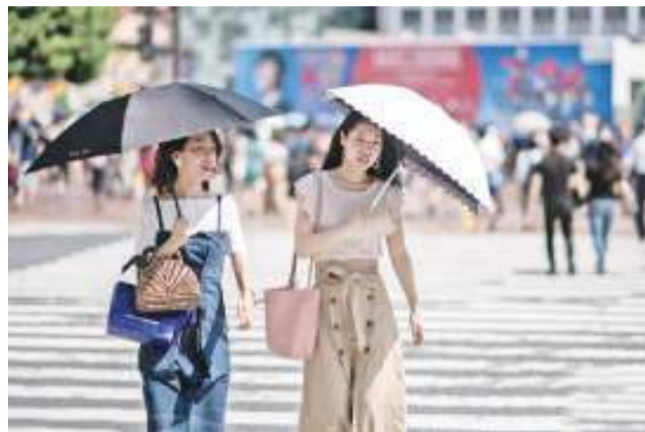
资料图:日本高温天气下的东京街头。