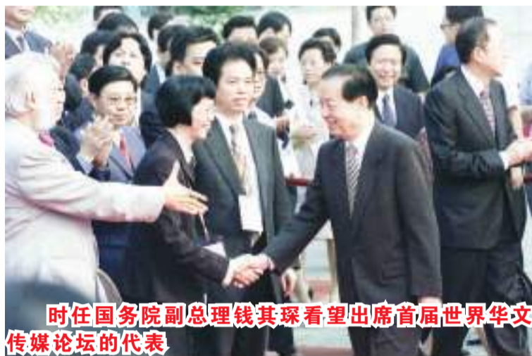
时任国务院副总理钱其琛看望出席首届世界华文传媒论坛的代表

2017年,我曾在由海外华人参与的“我与世界华文传媒论坛”征文活动后结集出版的《家园》一书的序中写下了这样一段话: