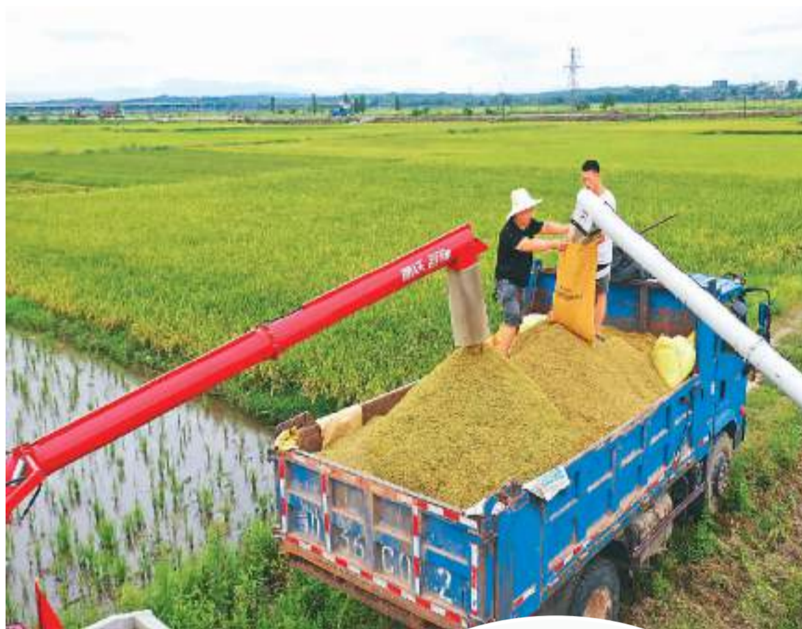
▲江西省吉安市永丰县结合水库流域生态综合治理，持续推进高标准农田建设，助力粮食生产早涝保收。图为7月3日，在永丰县示范水库灌区，八江乡高家村农民收割成熟的早稻。

为破解难题，统一当前高标准农田建设标准，农业农村部牵头修订《高标准农田建设通则》（以下简称《通则》），并将于今年10月1日起正式实施。