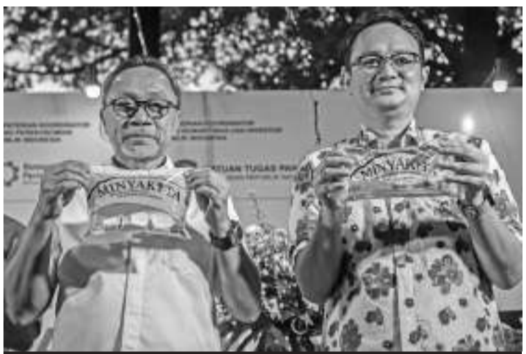
贸易部推出含津贴食用油 贸易部以每公升14000盾的价格推出了命名为“Minyak Kita”含有津贴的食用油。