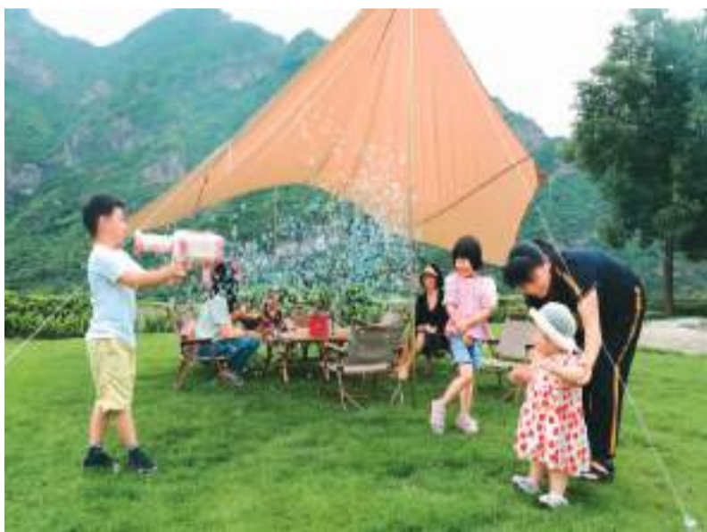
暑期来临，不少游客来到位于河北省保定市涞水县的野三坡景区露营，在青山绿水中尽享休闲时光。