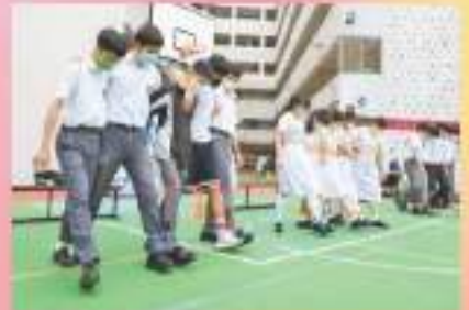
班際五人足球比賽。