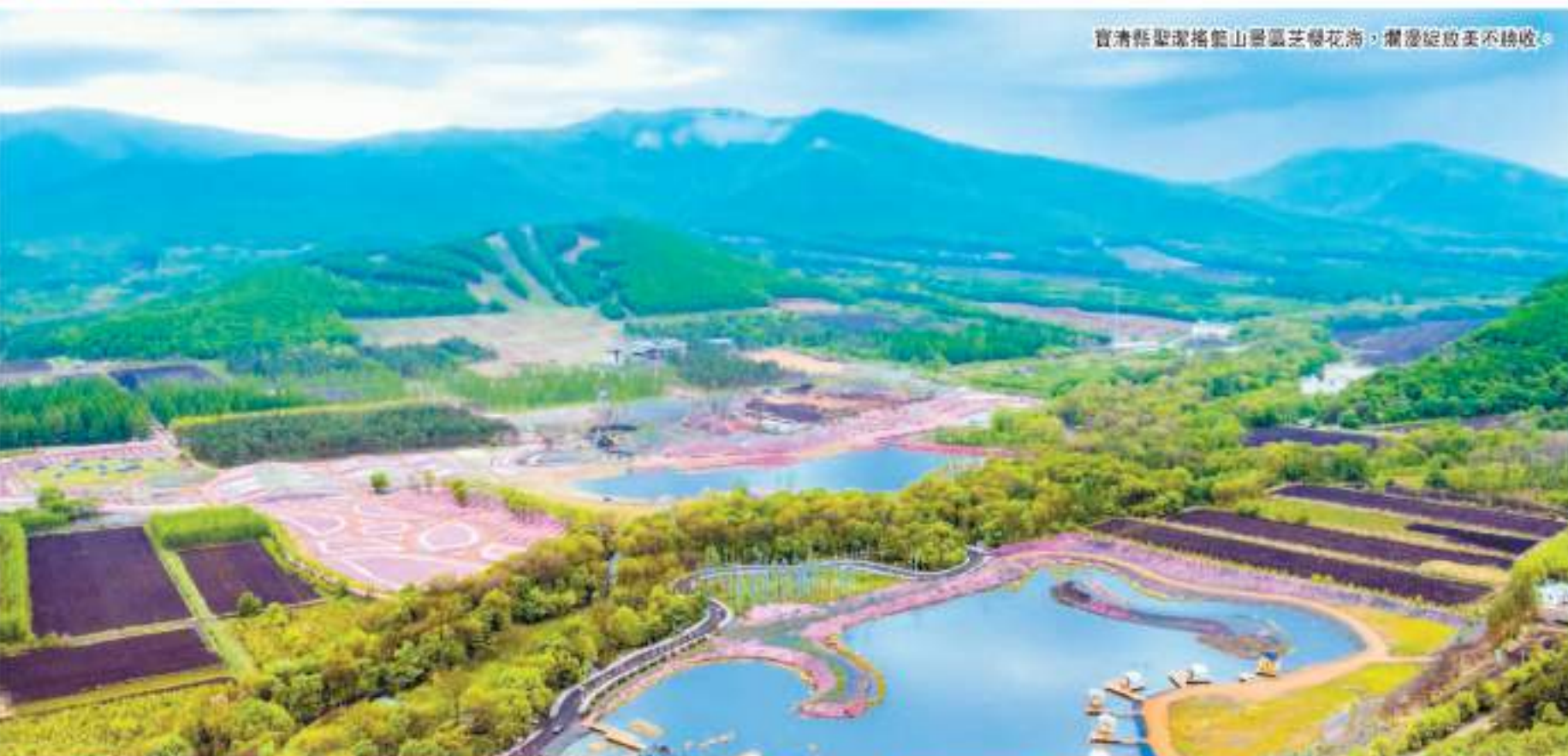
寶清縣聖潔搖籃山聖潔芝櫻花海，層層綻放美不勝收。