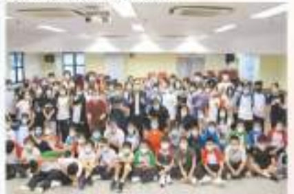
中一回歸生活節練習。