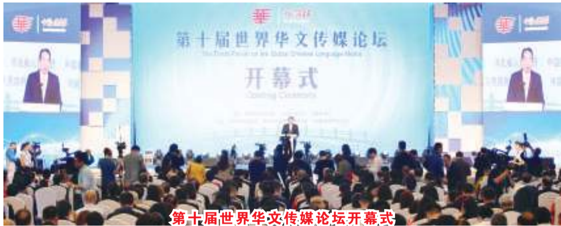
第十届世界华文传媒论坛开幕式