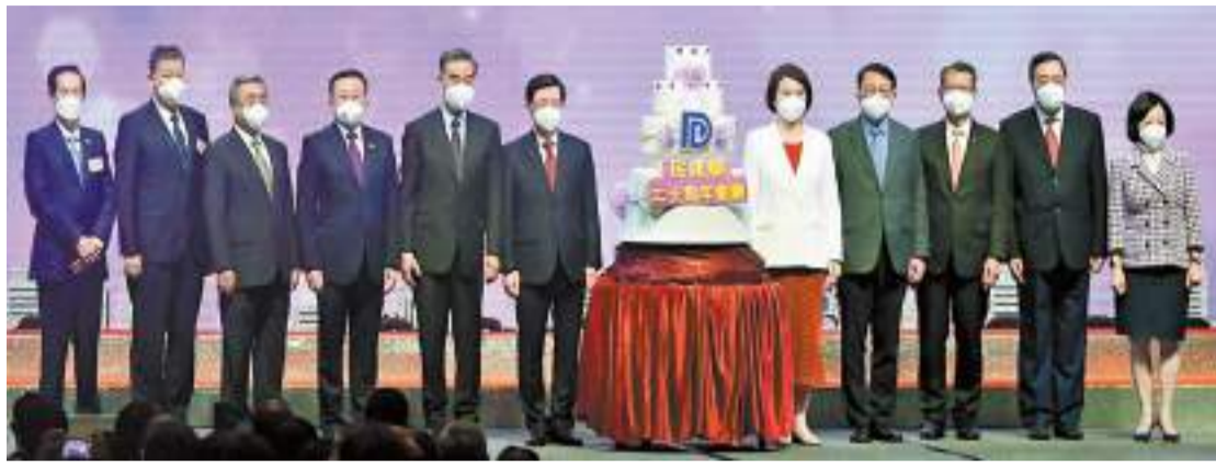
全國政協副主席梁振英（左五）、特區行政長官李家超（左六）、中聯辦副主任何靖（左四）等出席活動慶祝儀式。

他從練氣功的經歷獲得啟發，「愛國者治港」給予香港一套「拳」，期望每一名愛國者一同探索如何打好這套「拳」。他說令香港由治及興是中央給