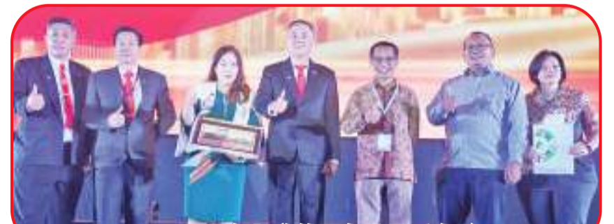
PSMTI 与各机关签署备忘录后合影