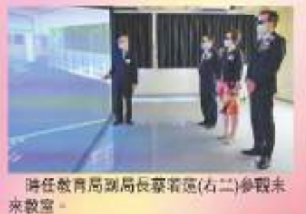
時任教育局副局長蔡若蓮(右二)參觀未來教室。