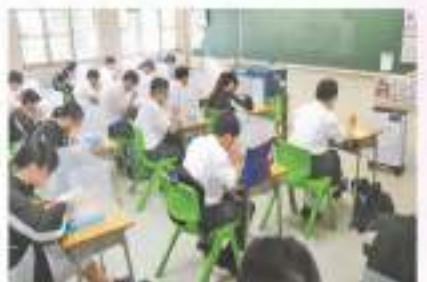
可藝中學，七成師生接種疫苗成去年全港首間恢復面授課堂學校，每間教室設面銀離子抗菌消毒空氣淨化機。