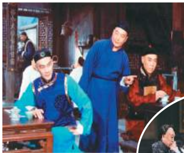
1958年，老一辈艺术家于是之(中)、蓝天野(左)、郑榕(右)等出演《茶馆》主要角色。

来自老一辈艺术家身上的传承，让我们有信心、有底气去做不同的尝试与探索。在庆祝北京人艺成立70周年期间，因为受新冠肺炎疫情影响，线下演出场次不多，我们启用了线上演出。