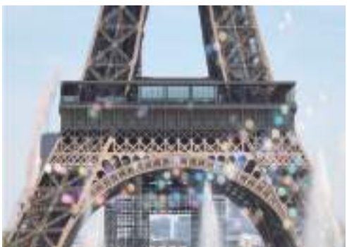
新華社北京7月5日電 法國周刊《瑪麗安娜》獲得的多份機密報告顯示,巴黎

埃菲爾鐵塔鏽迹斑斑,需要全面維修,但管理機構將祇給5%的塔身重新上漆,令專家為這座法國地標建築的狀況擔憂。