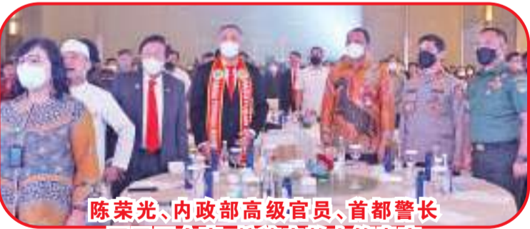
陈荣光、内政部高级官员、首都警长军区司令官、拉迪夫教士等贵宾