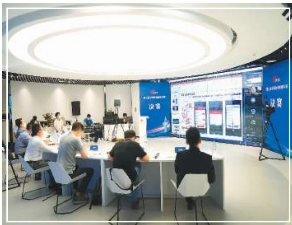
第七届中国海归创业大赛决赛现场，参赛团队在线上展开角逐。

自2015年首次举办以来，中国海归创业大赛已累计吸引3499个海归项目团队参赛，成为一个激发海归创业活力、鼓励支持海外留学人员回国发展的重要平台。