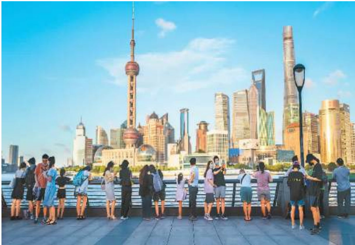
游客在上海外滩观光、拍照。