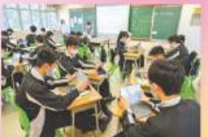
「自攜裝置」(BYOD)計劃於校園內推廣成功，達成「人人有裝置」的目標。