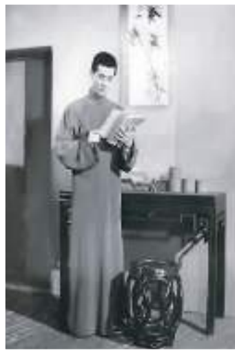
蓝天野在《北京人》中饰演曾文清。