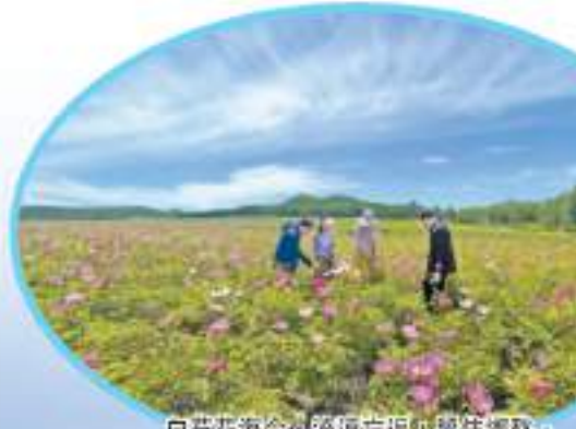
白芍花海令人流連忘返，留住鄉愁。

徐斌表示，力爭到2025年，全縣實現中藥材種植面積25萬畝以上，把寶清打造成黑龍江省種植規模最大、產品品質最優、科技含量最高、綜合效益最好、產業鏈最長的中藥材產業發展大縣、道地藥產經濟綜合實力排名跨入全省第一方陣，奮力打造「龍江東部名城」。