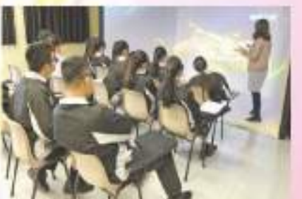
老師使用「沉浸式虛擬實境空間」，為同學講解海洋世界。