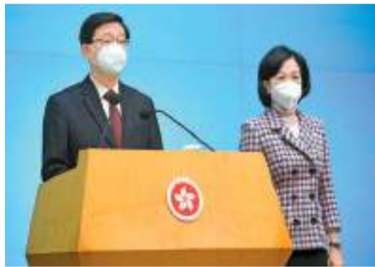
李家超表示，相信行政會議召集人葉劉淑儀能夠為香港發聲、講好香港故事。

李家超表示，行會成員提供的意見對行政長官的決策非常重要，他會根據基本法，在作出重要決定、向立法會提交草案以及制訂附屬法例等的時候，徵詢行會成員的意見。他再次感謝行會成員接受邀請，指他們有不同背景、經驗豐富，並讚揚行會召集人葉劉淑儀行政及從政經驗豐富，熟悉政府運作，亦非常關心社會事務，相信她在履行召集人職責時會很有成效，特別能夠為香港發聲、講好香港故事。