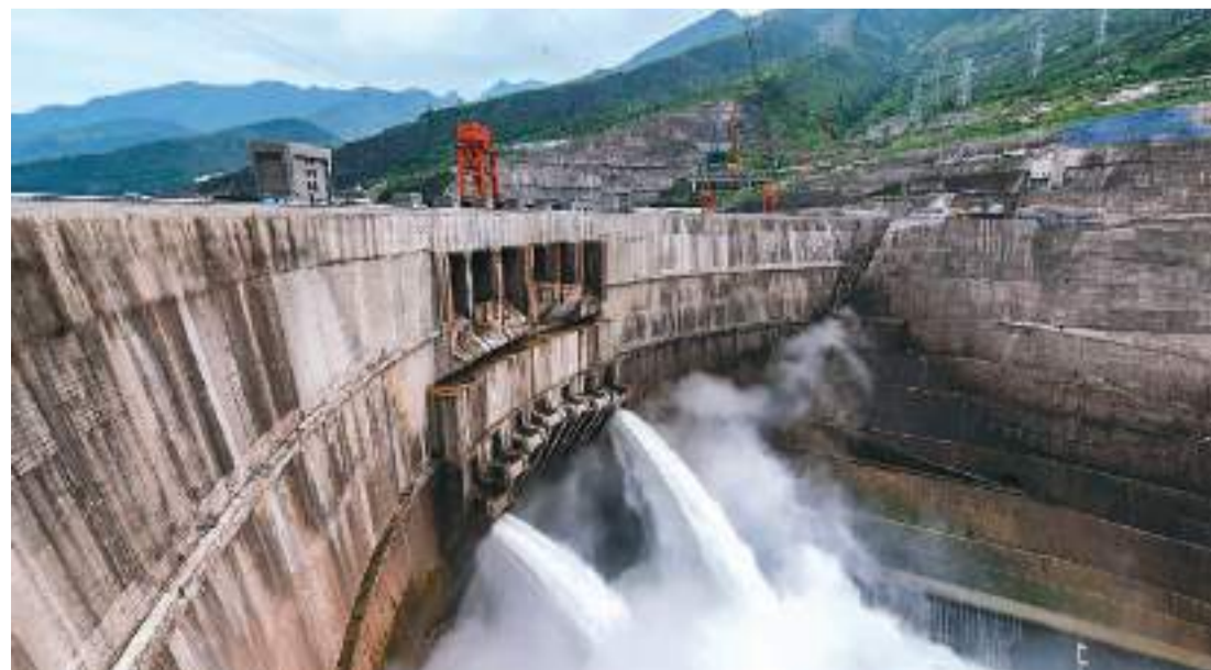
▲近日，白鹤滩水电站（如图）迎来首批机组投产发电一周年。白鹤滩水电站位于四川省宁南县和云南省巧家县交界的金沙江干流河段上，是实施“西电东送”的国家重大工程。

白鹤滩—江苏工程也是全球首个混合级联特高压直流工程，在世界上首次研发“常规直流+柔性直流”的混合级联特高压直流输电技术，集成特高压直流输电大容量、远距离、低损耗以及柔性直流输电控制灵活、系统支撑能力强的优势，示范引领意义重大。工程首次研制的可控硅换流阀装置可以快速实现毫秒级能量平衡，大幅提升华东电网受电能力。工程竣工投产后，虞城换流站将成为世界首座采用常规直流和柔性直流混合级联接线的换流站。