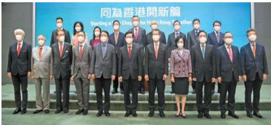
李家超在行政會議前與3名司長及16名行會非官守成員會見傳媒。

【香港商報訊】記者馮煒強報導：行政長官李家超昨日召開上任後首次行政會議，並在會議前與3名司長及16名行會非官守成員會見傳媒。李家超表示，房屋問題困擾香港多年，牽涉程序、法律、實際情況等事宜，他會與管治團隊全力以赴、勇於面對，以務實態度嘗試解決問題，包括令公屋輪候時間不再延長、在上任百日後的報告中交代有關加快建屋的新想法等。