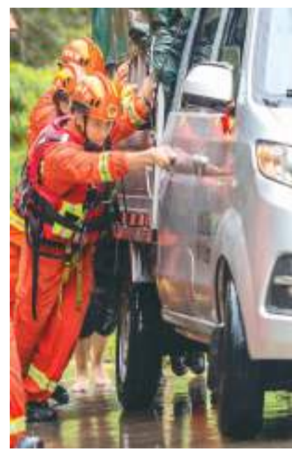
▲7月4日，湖南省永州市道县寿雁镇水源头村，救援人员在救援抛锚车辆。

迎“风”而动。国家防总启动防汛防台风Ⅲ级应急响应；中央气象台发布台风橙色预警；广东海南多地停课、停航、停运……多地多部门，第一时间部署防范应对。