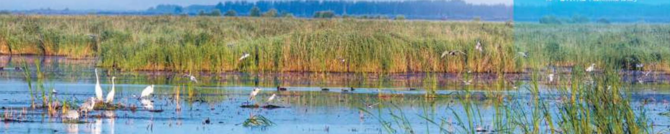
七星河國家級自然保護區列入「黑龍江省重要濕地名錄」。