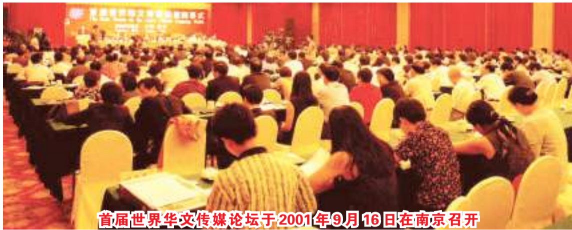
首届世界华文传媒论坛于2001年9月16日在南京召开