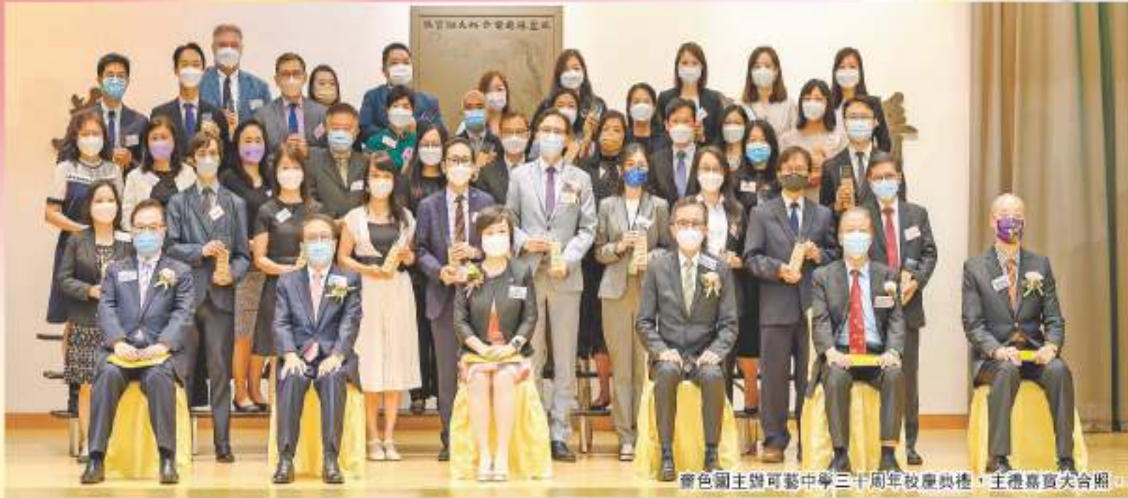
齊色園主辦可藝中學三十周年校慶典禮，主禮嘉賓大合照。