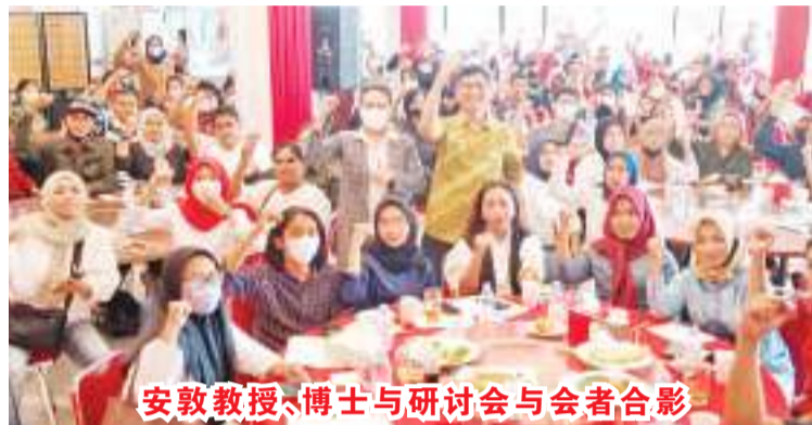
安敦教授、博士与研讨会与会者合影