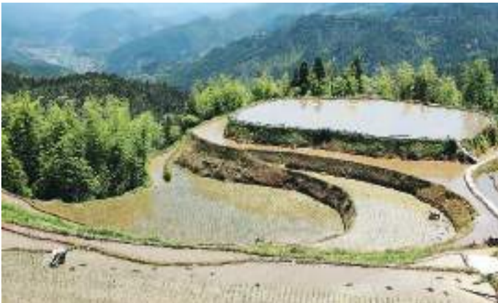
农民在江西省吉安市遂川县桃源梯田上插秧。

一方水土养育一方人，客家人在经历千辛万苦之后创造梯田，梯田也成就了客家人，成为人与自然和谐共生的生动体现。