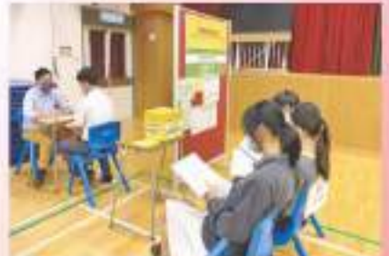
中六模擬放榜活動。