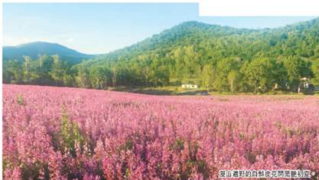
漫山遍野的白鮮皮花開是變幻初夏。

寶清這顆三江平原腹地的明珠，人文歷史，發展底蘊深厚。近年來，高度重視中藥材產業發展，通過組專班、出政策、建基地、擴規模、抓示範、促引領、強服務、重扶持等方式逐漸發展壯大該縣中藥材產業，形成獨特的發展模式。