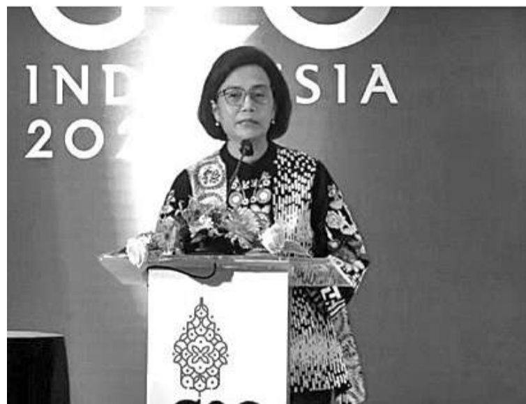
最近三年我国粮食处于安全状况 财政部长穆丽亚妮(Sri Mulyani Indrawati)声称，最近三年来，我国的粮食防御能力仍处于安全状况。