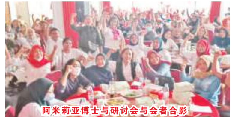
阿米莉亚博士与研讨会与会者合影