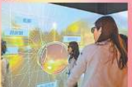
學生可透過沉浸式虛擬實境空間，了解人體環球結構。