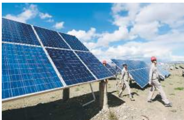
6月26日，大唐青海能源开发有限公司工作人员在青海省海南藏族自治州共和县塔拉滩光伏电站巡检。

海南藏族自治州能源局局长张振飞说，塔拉滩新能源产业发展过程中，探索出“光伏+牧场”方式，既减少了光伏企业成本，也助力农牧民增收，实现了经济、环境效益的双赢。“园区里现在有近2万只羊，一年差不多能卖200多万元，‘光伏羊’已经成为我们这里的新名片。”