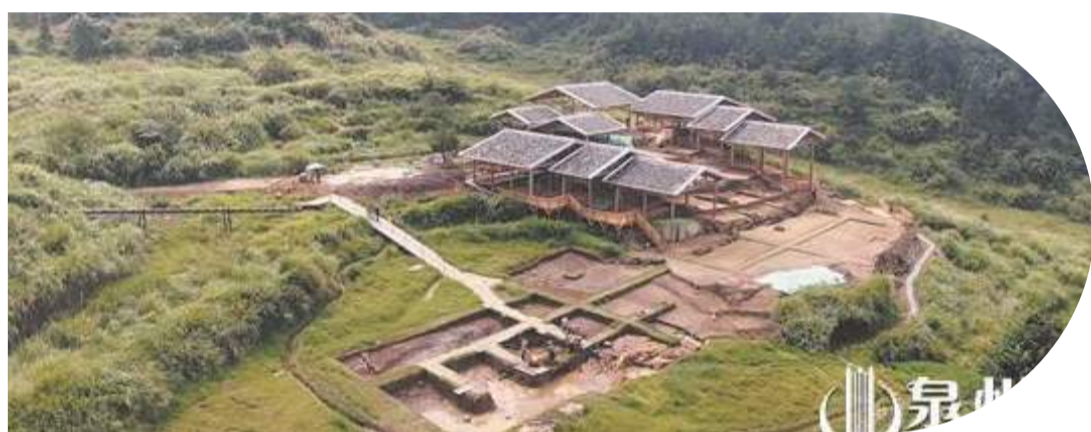
安溪青陽下草埔冶鐵遺址

系列考古之最令業界矚目，為申遺成功提供基礎性支撐，為講好泉州故事提供豐富素材。 2015年開始發掘的永春苦寨坑窯址，把中國燒制原始瓷歷史向前推移200年，成為“2016年度全國十大考古新發現”。 2019年以來，在國家文物局支持下，聯合考古隊開展對古城格局肌理、石湖碼頭、江口碼頭、晉江歷史岸線的考古調查勘探，以及對多個遺址的考古發掘工作，收獲累累碩果——對番佛寺遺址所在地塊進行考古調查與勘探表明，該遺址或為國內發現的唯一印度教寺廟遺址；南外宗正司遺址或為唯一尚能發掘的南宋時期宗正司遺址；泉州市舶司遺址或為我國唯一保存至今的古海關遺址；安溪青陽下草埔冶鐵遺址是國內首個考古發掘的塊煉鐵遺址；德化容尾林窰系首次在一個窰址中，揭露出四座橫跨宋元明清四代的古窰遺址。德化窰考古遺址公園、永春苦寨坑考古遺址公園列入第一批省級考古遺址公園，其中，德化窰遺址列入國家《大遺址保護利用“十四五”專項規劃》；剛剛結束的福建省考古遺址公園現場推選會上傳來消息，磁窰系金交椅山窰址列入第二批省級考古遺址公園，南外宗正司遺址、安溪青陽冶鐵遺址作為第二批省級考古遺址公園立項。 泉州通過加強與中國社科院考古研究所、北京大學考古文博學院、福建省考古研究院等專業院校、機構合作，正繼續推進市舶司遺址、安溪青陽冶鐵遺址等考古發掘工作。同時，加快推進完成苦寨坑遺址、德化窰址、南外宗正司遺址等考古遺址公園的規劃編制，推動考古遺址公園取得實質性進展。 2001年—2002年，在泉州古城南部的德濟門遺址考古發掘中，揭露出遺址面積2500平方米，一座宋、元、明三代疊壓有序、結構完整、規模宏大的古城南門遺址，發掘出土了伊斯蘭教、印度教、佛教、基督教等宗教石刻。 考古助力泉州申遺成功 近年來，泉州考古工作屢有重大進展，一