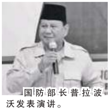
国防部长普拉波沃发表演讲。

【本报讯】国防部长普拉波沃周日(3/7)在普拉维渣雅大学举行的全国大学社会科学学院院长论坛的工作会议上指出,不少国家认为,佐科维总统的政府在应对新冠肺炎大流行与经济影响方面是成功的。世界上许多国家认为佐科维的政府成功应对新冠肺炎大流行的国家,在如此巨大