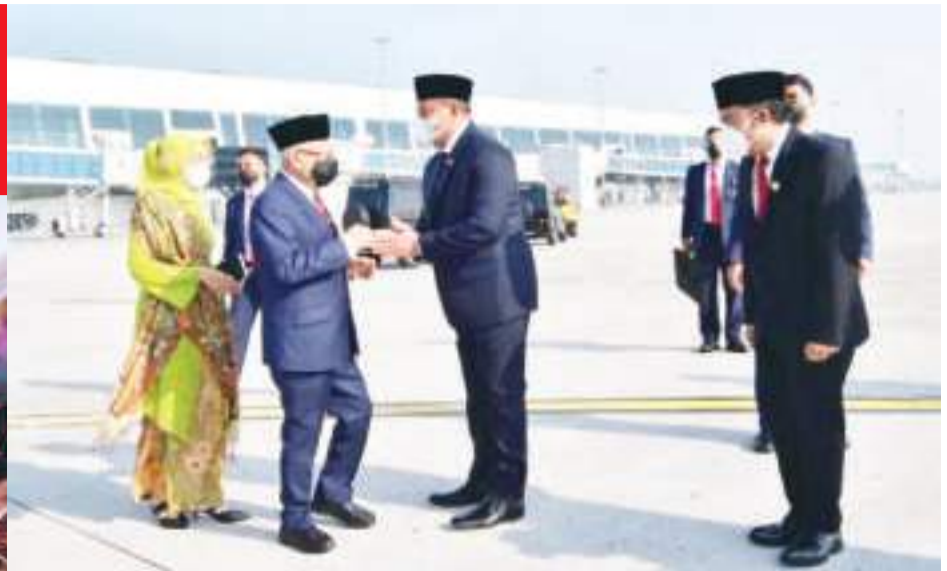
副总统将飞往沙特阿拉伯朝觐 ▲ 7月5日,马鲁夫副总统和夫人在苏加诺哈达机场将出发前往沙特阿拉伯朝觐的情形。