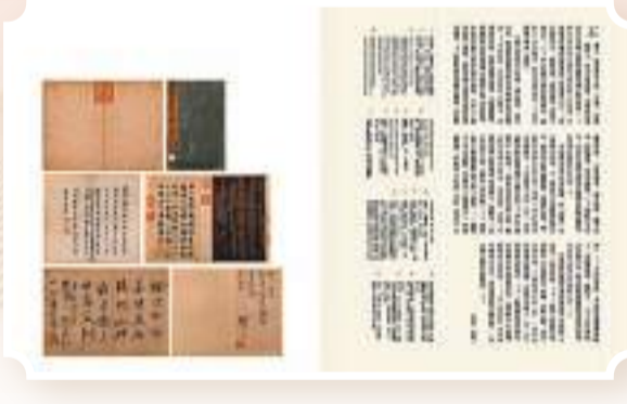
▲米芾《行書研山銘》內文版式。