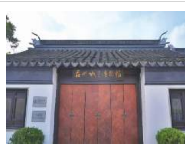
苏州城建博物馆大门。

人，与方若、张叔驯并称“近代泉家三杰”。1957年9月，罗伯昭将其收藏的15431件文物捐赠给北京历史博物馆（现中国国家博物馆），至1965年，又先后捐赠文物70余件（套）。罗伯昭捐赠的钱币通古贯今，兼及中外，品相极精，版别丰富，与其他泉家捐赠的文物共同奠定了国博钱币类藏品的基础。 此次展览中展示了罗伯昭代表性的钱币藏品140余件，包括中国古代钱币、外国钱币、革命根据地货币等，此外还有青铜器、玉器、瓷器等罗伯昭捐赠的其他类别文物。通过捐赠档案、信札、拓片等展品，观众可以感受到罗伯昭捐赠义举背后的殷殷爱国情。