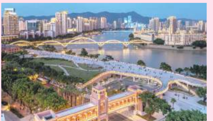
“闽江之心”青年桥。