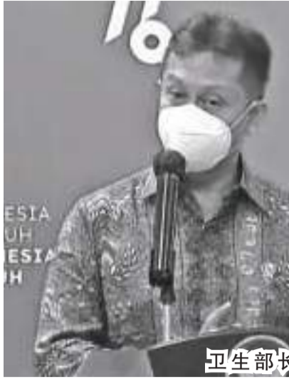
卫生部长古纳迪(Budi Gunadi Sadikin)

【本报讯】卫生部长古纳迪(Budi Gunadi Sadikin)估计,雅京专区的新冠肺炎病例率将在不久的将来达到顶峰。古纳迪周一(4/7)在雅加达南区卫生部大楼发表新闻声明时指出,雅加达拥有最多的奥密克戎病例。我认为,雅加达将很快达到顶峰。回顾2021年7月在印度尼西亚发生的德尔塔疫情,当病毒变体的主导地位已经超过总人口的80%时,人口水平上新冠肺炎病例的峰值就出现了,即发生在德尔塔与奥密克戎变体 BA.1 和