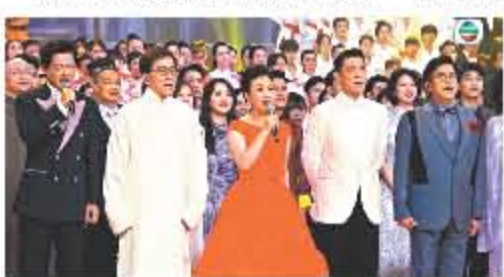
《慶祝香港回歸祖國 25 周年文藝晚會》群星雲集。

《文藝晚會》由汪明荃、陳貝兒及陸浩明擔任大會司儀,晚會由五個環節串連,分別是「同慶」、「同心」、「同行」、「同夢」和「共未來」,展示香港回歸祖國 25 年來的發展和故事。當晚演出之著名歌星及藝人包括成龍、劉德華、譚詠麟、謝霆鋒、陳偉霆、陳潔靈、羅家英、李克勤、周傑、吳華倫、姚珏、郎朗、泳兒、李幸倪、王菀之(JW)、姚焯菲、魏柔美、詹天文、香港中樂團、香港管絃樂團、香港舞蹈團及多個文藝團體逾 700 人傾力演出,攜手展現香港精神。