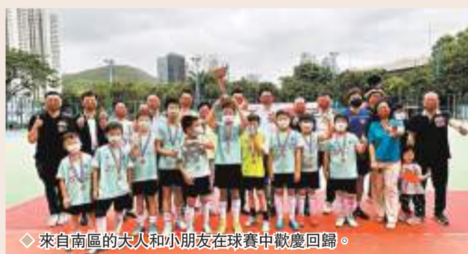
◆來自南區的夫人和小朋友在球賽中歡慶回歸。

香港文匯報訊（記者 子京）「慶祝香港回歸25周年南區體育系列啟動禮暨四區足球比賽」日前在鴨脷洲公園足球場舉行，來自南區的大人和小朋友一同參與，在足球賽事中歡慶回歸25周年。