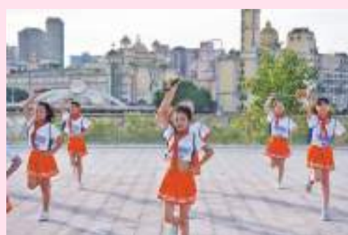
少先队员载歌载舞,欢乐“快闪”。

日葵的小朋友从四面八方向党旗聚拢,不少驻足观看的福州市民和游客也纷纷接过志愿者送上的小型党旗,情不自禁加入“快闪”队伍。大家挥舞着手中的旗帜,为中国共产党成立101周年送上诚挚的祝福。