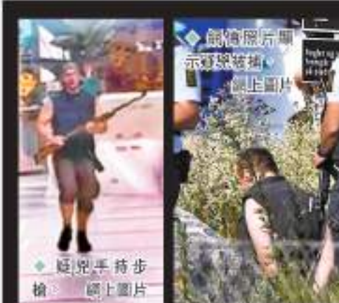
疑兇手持步槍。