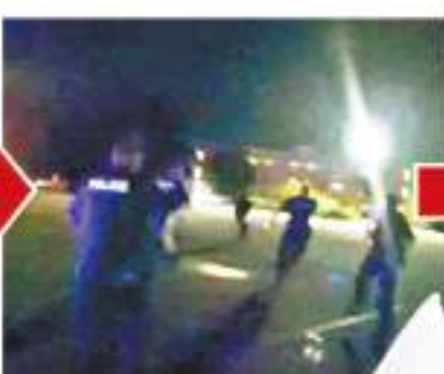
警員追截並連開多槍。