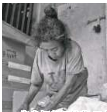
朱米娅老姬储蓄15年虔诚奉献一头价值2200万盾的祭祀牛。