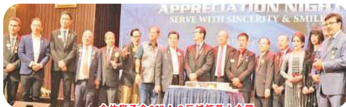
全体狮子会 307A-2 区域领导人合照