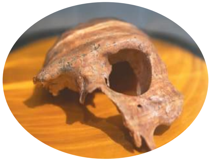
左图：南京直立人1号头骨化石。右图：明代沐启元墓出土的嵌宝石金盒。