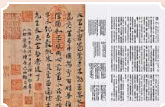
▼鄧文原《草書急就章》內文版式。

據故宮出版社介紹，「國之瑰寶——故宮博物院藏晉唐宋元書畫」圖錄有兩種，分別為8開版本和16開版本，兩書文字內容一致，均採用特種藝術紙印刷。但在圖版的編排上8開本更為充分和細緻，設計上也更精緻，活脊裝幀使作品完全能展平，圖錄中所收錄的書畫名跡，除展示完整圖像外，更有超高清局部畫面，具有相當的收藏價值。16開本則為軟精裝，便於攜帶，極具性價比，適合普通讀者作為案頭隨時翻閱的日常讀物。8開和16開版本在香港故宮博物院均有銷售。