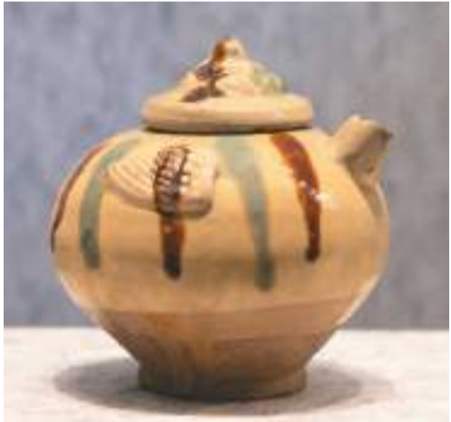
秦淮河西水关出土的唐代长沙窑青釉褐绿彩瓷壶。

隋唐至宋元，经历短暂的低潮后，南京长江文化有了新的发展。隋唐时期，南京繁华与衰落的对比孕育出许多“金陵怀古”作品，如刘禹锡的《乌衣巷》、杜牧的《泊秦淮》、李白的《金陵三首》。南唐定都南京，扩建城邑重建金陵，南京城形成滨江格局。 展厅中有一组秦淮河西水关出土的长沙窑瓷器，器型多样，主要为碗、盘、罐等生活用器，大部分为青黄色釉，装饰题材丰富，其中以褐绿彩绘花鸟图案最为精彩。这批瓷器的出土说明秦淮河是唐代南京重要的航道，贸易运输频繁。 宋元时期，南京为江南重镇，特别是宋代政治中心南移后，南京作为临安（今杭州）的陪都，城市经济得以复苏，为后来明王朝定都南京奠定了基础。 1368年，朱元璋在南京称帝，国号大明，南京第一次成为统一王朝的都城。明代沐家算是顶级豪门。沐英作为朱元璋的养子，受命平定云南后便世代镇守云南，家族世袭黔国公爵位，历经十二代、十四任，贯穿明朝始终。 沐氏家族墓地位于南京将军山，墓中出土的嵌宝石金钿、葫芦形金盒等极其奢华。嵌宝石镶玉金带板和嵌宝石金盒的主人都是沐启元，他是最后一位归葬金陵的黔国公。金带板共20块，以累丝工艺制成，中间镶玉，周围镶嵌一圈红、蓝宝石和珍珠。珍珠已风化，仅余空托。金盒为多面体，每个面镶嵌着红、蓝宝石，有个卡口推测可以打开，内部可能装有香料或丹丸等。 明代奉行“以德睦邻”外交政策，明成祖、明宣宗先后派遣郑和下西洋，航迹遍及南亚、西亚、东非。据记载，郑和船队中的大型海船长四十四丈四尺，宽十八丈，有九桅十二帆，可乘坐一千人。郑和下西洋的船只为南京宝船厂制造，这是明代最重要的官办造船机构。展览中的木榑、木桨等船用构件，令人管窥南京宝船厂的制造技艺。郑和船队自南京龙江关七下西洋，留下了彪炳史册的壮举，长江文化与海洋文化交融，形成了绚丽夺目的画卷。 南京，伴随着中华文明的历史进程，从秦淮河源头的江南聚落发展为中国统一王朝的首都，并沿着长江走向海洋，汇入滚滚浪潮中。