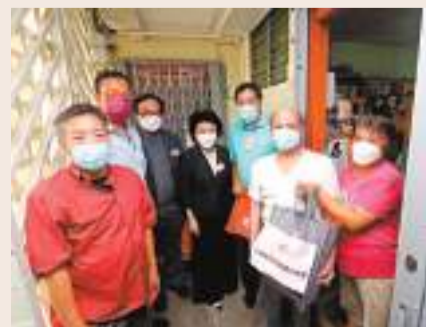
◆港區省級政協委員聯誼會舉辦「慶香港回歸祖國25周年福袋送暖探訪行動」。

香港文匯報訊（記者 子京）港區省級政協委員聯誼會日前聯同經民聯、香港一帶一路總商會、香港北京交流協進會、香港陝西社團聯合總會舉辦「慶香港回歸祖國