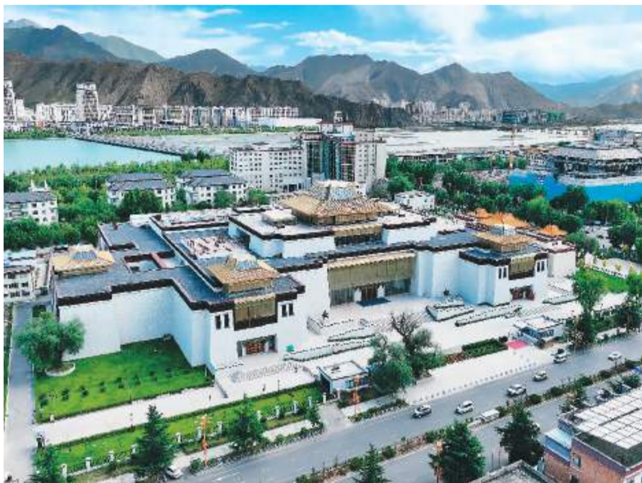
日前, 记者获悉西藏博物馆新馆将于近期开馆。由国家投资6.6亿元实施的西藏博物馆改扩建工程于2017年10月奠基动工, 历时近5年, 是西藏自治区一项重要文化惠民工程。西藏博物馆于1999年10月落成开馆, 是西藏唯一一座综合性国家一级博物馆。西藏博物馆新馆项目总占地面积达6.5万

今年前6月, 中欧班列累计开行7473列、发送72万标准箱, 同比分别增长2%、2.6%; 西部陆海新通道海铁联运集装箱班列图定线路由9条增至12条, 累计发送货物37.9万标准箱, 保持强劲增长态势。