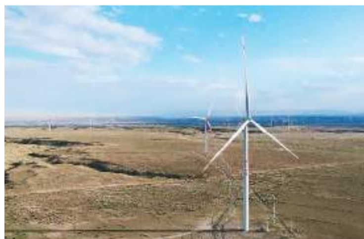
6月26日，在青海省海南藏族自治州共和县拍摄的风力发电机。