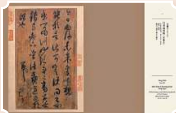
▲▼王羲之《行書雨後帖》(宋臨摹本)內文版式。