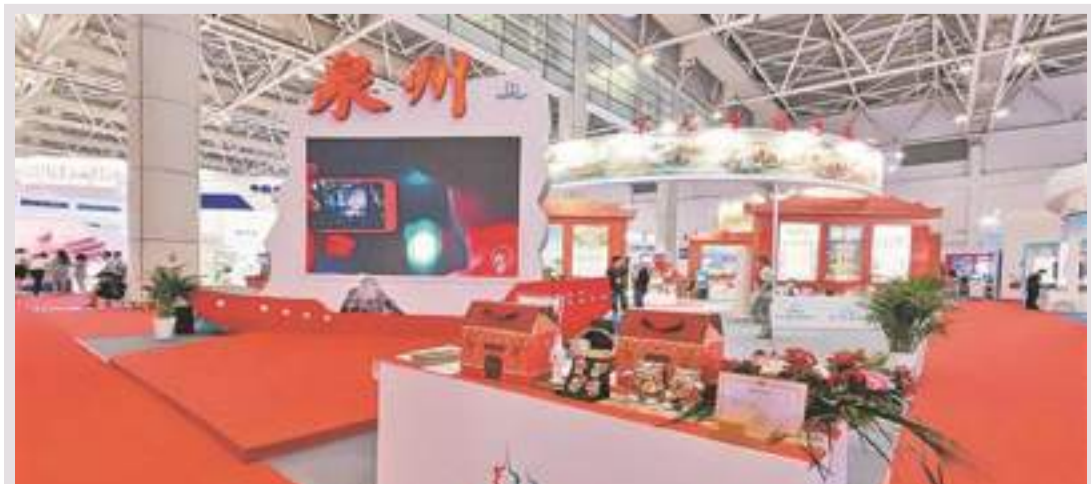
“世遺泉州館”吸引全市48家文旅企業參展

泉州網訊 (記者郭雅瑩 通訊員曾世彬) 18日至20日，第二十屆中國·海峽項目成果交易會在福州市海峽國際會展中心舉行。海創會上，“世遺泉州”文旅經濟專館突出展示世遺、古城、海絲、閩南文化特色等文旅經濟發展成果及項目招商，收穫多個獎項。 受本屆海創會組委會邀請，我市作為文旅經濟展區板塊的主賓市，市文旅局組織布設“世遺泉州”文旅經濟專館，以“宋元中國·海絲泉州”世遺品牌為主題，吸引了48家文旅企業單位參展。 據悉，“世遺泉州”文旅經濟專館在主題上突出世遺品牌和閩南文化元素，全面展示22個泉州世遺點及整體形象；在內容上突出非遺體驗和文旅展銷，包括惠女服飾、水密隔艙福船制造技藝、茶道、香道體驗，各類老字號、古早味伴手禮、文創產品展銷，多個智慧旅遊雲平臺及全域旅遊卡推廣；在活動上突出資源和項目招商推介，通過海創會平臺開展世遺泉州文旅資源和項目招商推介，印制發放《泉州市文化和旅遊招商項目手冊》等，獲評第二十屆海創會組委會頒發的“優秀組織獎”“創意設計獎”“最佳人氣獎”“最佳宣傳推廣獎”。 氣之先”。他們將先進的科學技術和思想帶回泉州，從各個方面對泉州社會的發展產生深遠的影響。