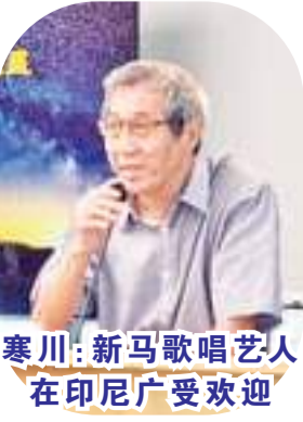
寒川:新马歌唱艺人在印尼广受欢迎