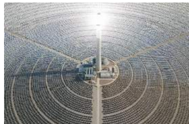
6月8日在海西蒙古族藏族自治州德令哈市光伏（光热）产业园拍摄的青海中控德令哈50兆瓦光热电站。