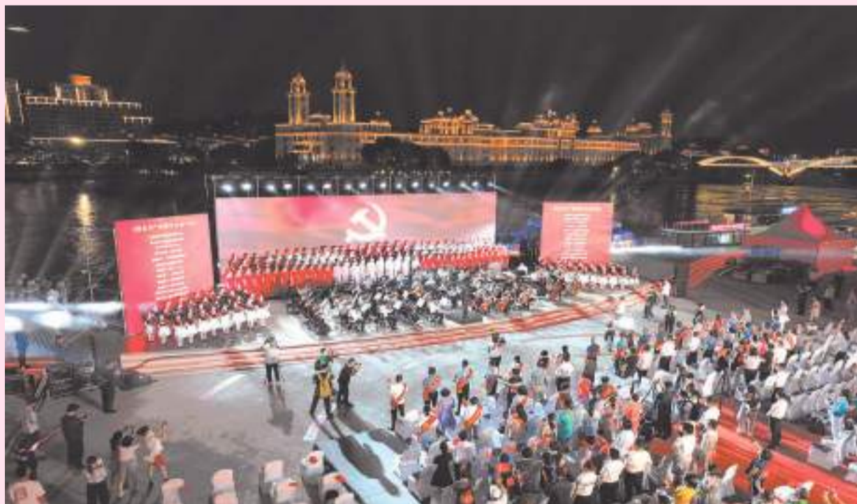
2022福州“七一”两江四岸歌会现场。