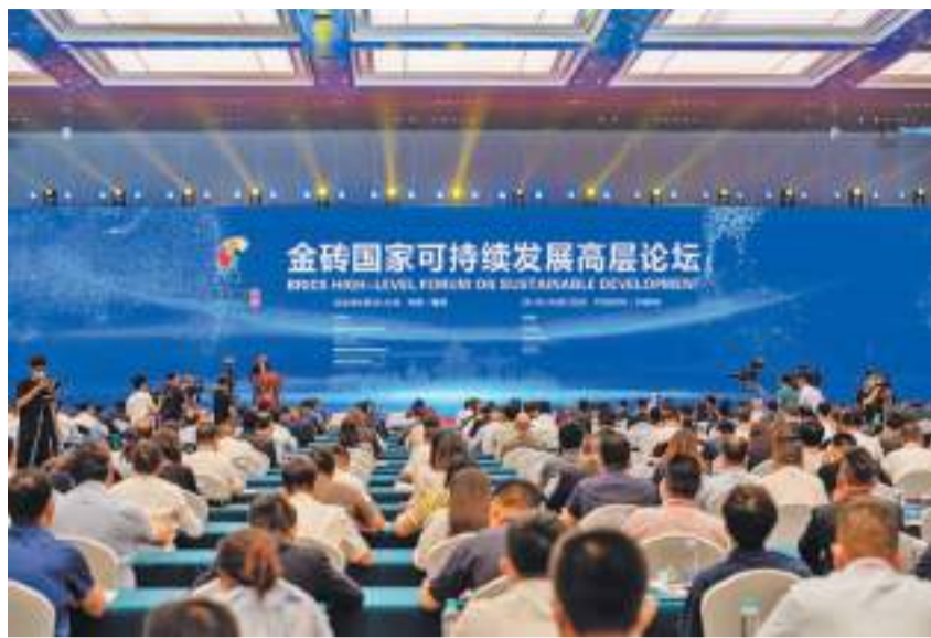
金砖国家可持续发展高层论坛在榕举行。