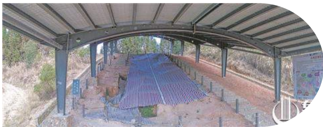
永春苦寨坑原始青瓷窯址