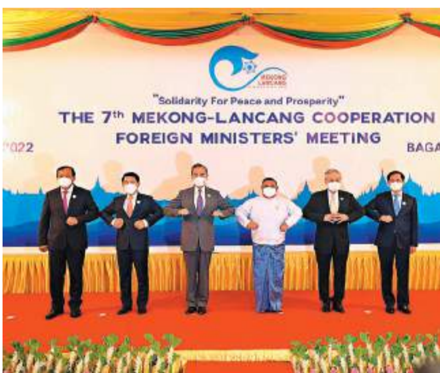
湄澗江-湄公河合作第七次外長會4日在緬甸蒲甘舉行。中國國務委員兼外長王毅和緬甸外長溫納貌倫共同主持會議，老撾副總理兼外長沙倫賽、柬埔寨副首相兼外交大臣布拉索昆、泰國副總理兼外長敦、越南外長裴青山出席。

密切人文交往。包括舉辦湄澗國家婦女組織領導人視頻對話會、地方政府合作論壇、世界文化遺產論壇等系列活動，完善湄澗旅遊城市合作聯盟建設，成立電視媒體合作聯盟，打造婦幼、青年、地方、體育、媒體合作新亮點。