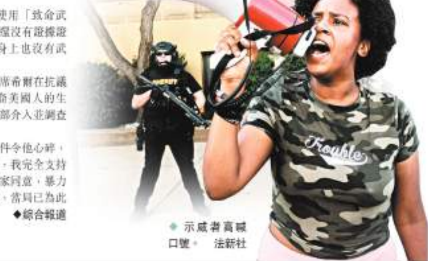
示威者高喊口號。

阿克倫市長霍里根表示，這類事件令他心碎，「許多人希望公開表達他們的不滿，我完全支持市民和平集會的權利，但我希望大家同意，暴力和破壞不是解決之道。」希爾稱，當局已為此展開獨立調查。