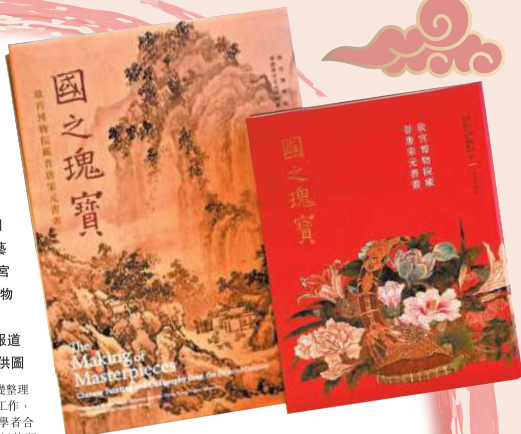
▲兩個版本的「國之瑰寶」圖錄。

此外，該書圖版全部出自故宮博物院對作品原件的最新拍攝，並經過了多次顯密比對、校色工作。設計精美，印刷精良，圖版展示充分，色彩還原準確，細節表現清晰。在展覽結束後，各讀者仍可將這些國寶書畫的精彩內容收藏欣