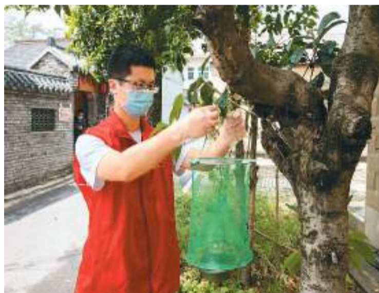
图为4月23日，安徽省含山县铜闸镇卫生院志愿者走进太湖八姓村投放灭蝇诱饵。

在健康促进方面，协和医院只是一个缩影，所有医疗机构都在践行。毛群安表示，在健康促进工作中，医疗机构和医务人员正从以治病为中心，向以人民健康为中心转变，治疗疾病过程中更加注意健康知识的普及、健康技能培训，让公众更关注到疾病预防以及病后的康复，从而真正提升公众健康水平。总之，“要把医院真正建设成为一个健康促进的场所。”毛群安说。