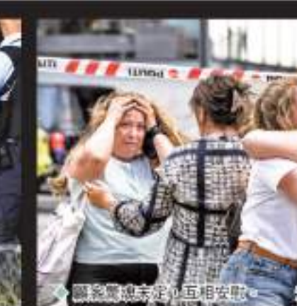
關係緊張案發後互相安慰。