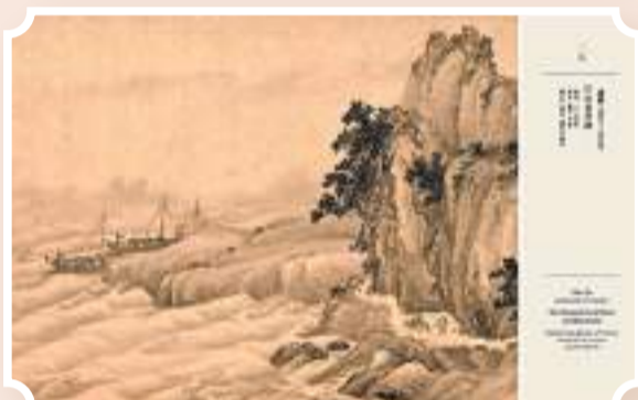
▲趙孟頫《江山萬里圖》內文版式。