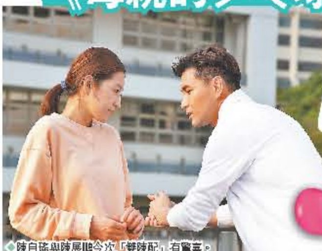
陳自瑤與陳展鵬今次「雙陳配」有驚喜。