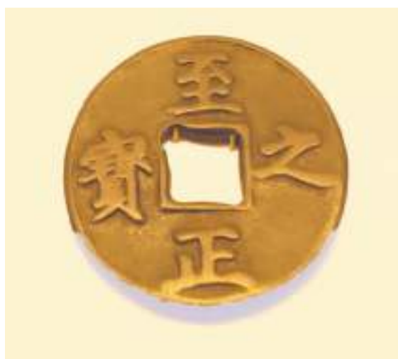
元顺帝至正年间“至正之宝”。