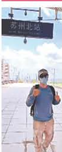
甄子丹在蘇州北站拍照留念。

香港文匯報訊(記者文芬)有「宇宙最強」之稱的甄子丹(丹爺)最近身處內地,並趁著工作空檔,偕老婆汪詩詩到處遊玩,享受二人世界。