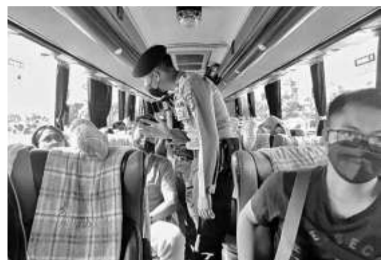
政府收紧社区活动限制措施 政府为了要遏制新冠变异体BA.4和BA.5广泛传播,把某些地区的社区活动限制措施(PPKM)升级,同时责成人们在户外活动必须戴口罩。

有关国家注资金将分配给多项工程,分别是2万亿盾预算通过建设基础设施以优化和提高在爪哇、马都拉、巴厘三地的电力供应;国电公司发放4.5万亿盾在加里曼丹省偏远地区建设水力发电站(PLTA)的传输功能;还有3.5万亿盾建设微水电站(PLTM)、水力发电站(PLTA)及蒸汽发电站(PLTMG)为基础的新再生能源发电站、以及在偏僻地区的电力传输器。达尔万指出,目前我国为3T地区每个用户供应电力基础设施的投资成本非常高昂,为每个用户拨出高达2500万盾至4500万盾的成本。因此开发这方面电力基础设施事项是不可实行的。(Ing)