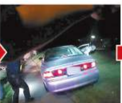
沃克試圖逃跑，跑入停車場。