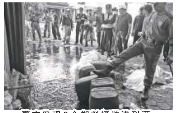
警方发现9个塑料桶装满烈酒。

此前,7月4日中午在上述多个地点发生的骚乱导致多处的建筑物及机动车辆损坏。日惹特区警署透露称,发生骚乱事件是由于一群人对于有关3人于7月3日凌晨在斯勒曼Jambusari受攻击的案件处理结果甚感不满引起的。据悉,两派人曾在7月2日晚上在巴巴尔沙里区的一家卡拉OK场所内发生争执。(Ing)