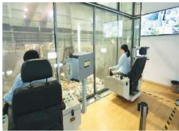
图为6月7日，在四川省眉山市仁寿县垃圾焚烧发电厂的垃圾吊控制室，工作人员正在操作垃圾焚烧工作。

通过近几年的工作，各地健康城市的综合指数和分指数稳步提升，人群健康状况持续改善，婴幼儿死亡率、5岁以下儿童死亡率、孕产妇死