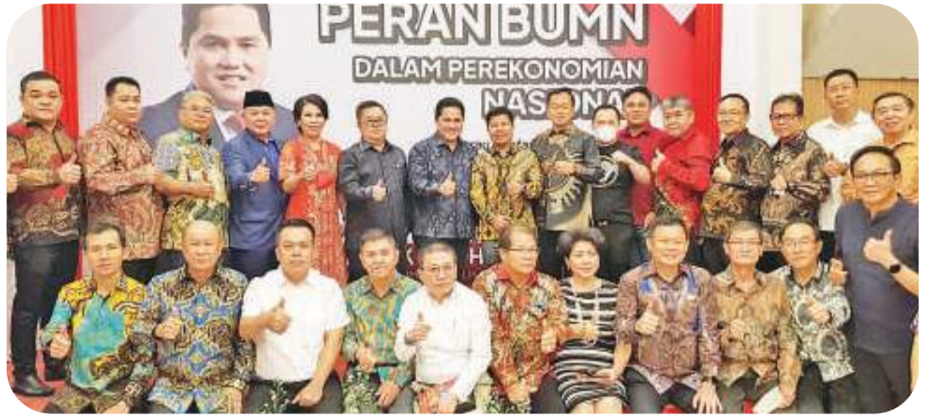
埃里克、林德纯、莎多诺、蔡翠媚、刘国辉、亨德拉宛教授与印尼西加华人企业家协会的企业家合影

【本报讯】国企部长埃里克(Erick Thohir)于周一(2022年7月4日)出席由印尼西加华人企业家协会举办题为“国企在国民经济中的作用”的聚会活动,此活动在雅加达中区 Petojo 镇 AMSangaji 街 Empurau 餐厅举行。