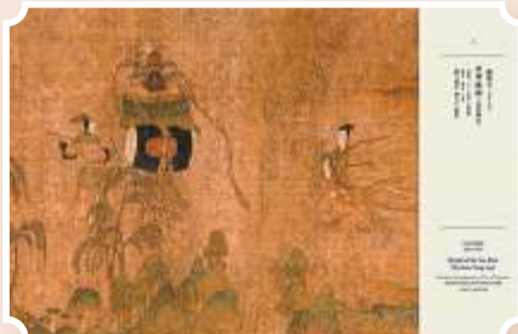
▲顧愷之《洛神賦圖》(北宋摹本)內文版式。