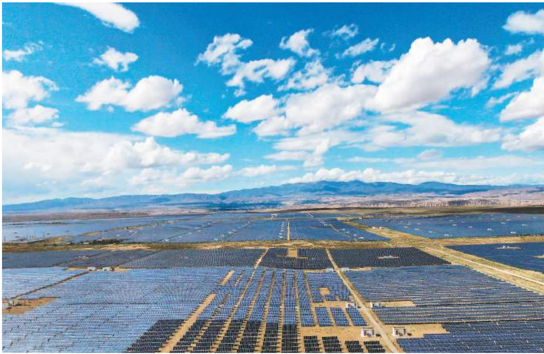
6月26日，无人机拍摄的青海省海南藏族自治州共和县光伏电站。