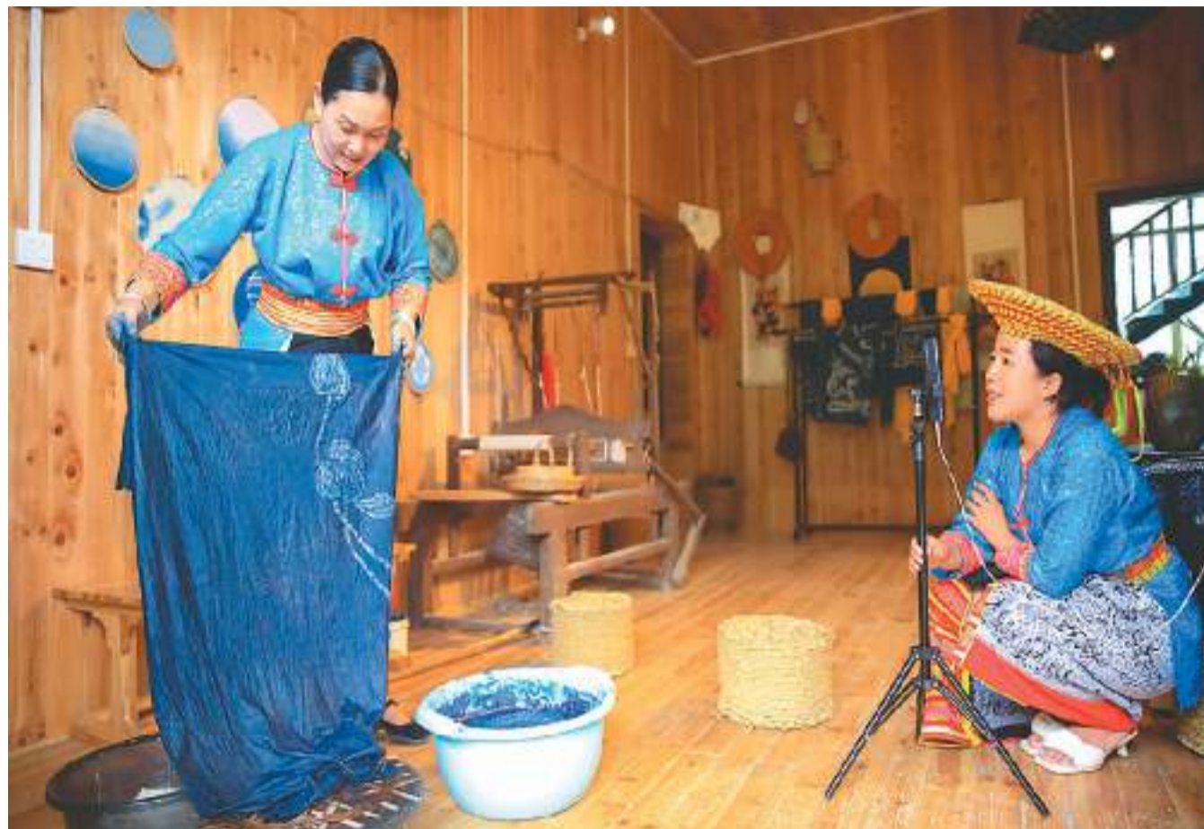
在湖南省邵阳市隆回县虎形山瑶族乡白木洞村花瑶文创基地，村民的“直播带货”吸引了不少网友关注。

打开戏曲APP“峰剧场”，琳琅满目的剧目呈现于手机屏。从京剧、秦腔、黄梅戏、河北梆子，到小众地方戏、蒲剧、绍剧等，许多剧种的作品都可以在“峰剧场”找到。“6.6元可观看一部戏曲录像，9.9元可收看一场直播，我爱看戏，因为好看好听，故事动人，人物形象