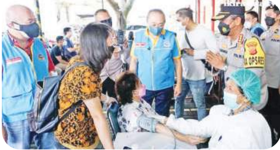
希达悦警官在现场视察时