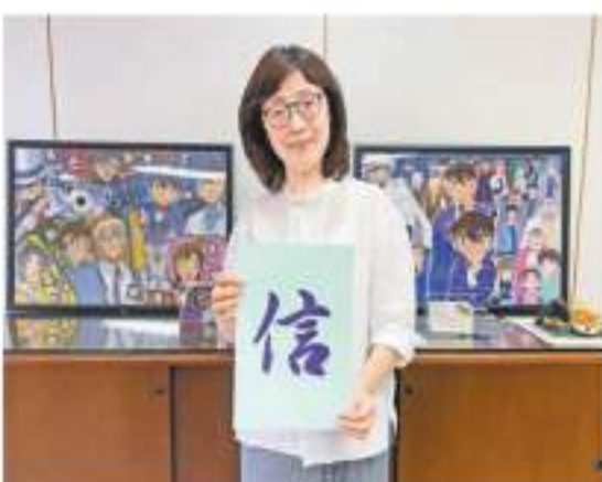
發展局局長雷漢豪為應屆中學文憑試考生送上「信」字。