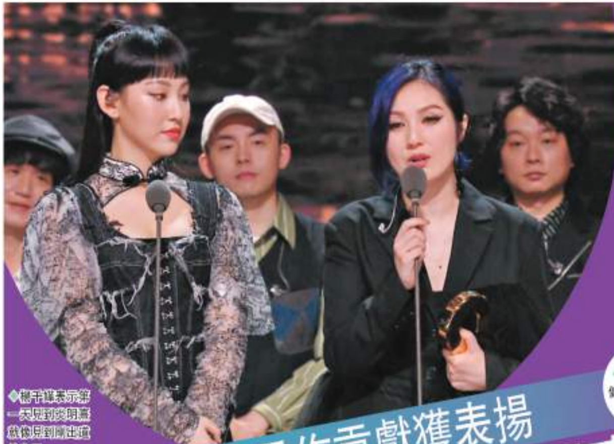
楊千嬅表示第一次見到明熹就感到剛出道的自己。