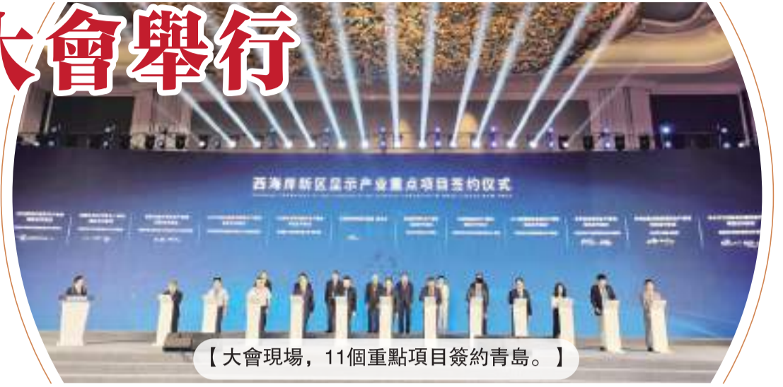
【大會現場，11個重點項目簽約青島。】