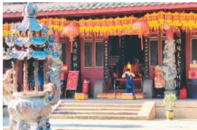
泉州天后宫内，香客祭拜的风俗依然延续下来。天后宫是体现世界海洋贸易中心管理保障的代表性遗产要素，体现出民间信仰与国家意志相结合对海洋贸易发展的共同推动作用。泉州天后宫的建筑规格高于湄洲祖庙。

址遍布了海边与山区，宋元泉州窑址的密集程度堪比浙江龙泉和江西景德镇。出使真腊（即柬埔寨）的元朝使者周达观也在当时真腊都城吴哥见到了泉州出产的青瓷。同时，有利于水陆转运的桥梁也被大量修建。有宋一代，福州共造桥18座，泉州却建造了115座，仅平原核心地带的晋江县就建了43座桥梁。