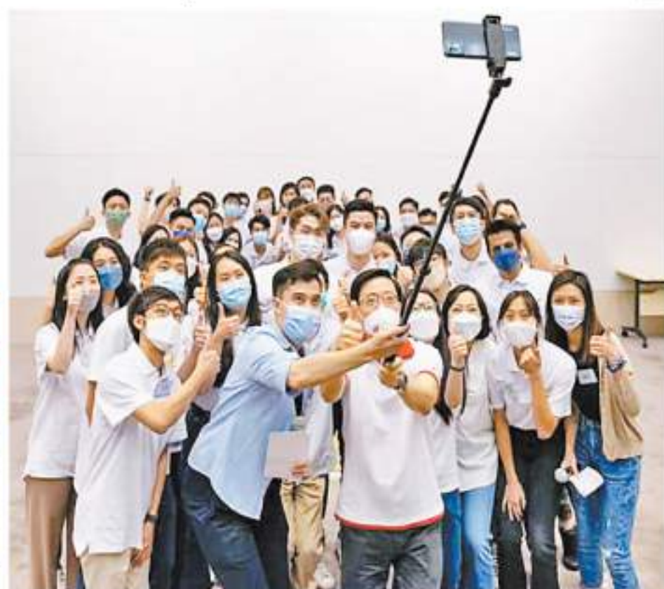
圖為李家超與年輕人自拍合照。