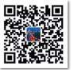
青島發佈 官方微信二維碼