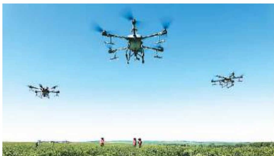
无人机在内蒙古自治区扎兰屯市成吉思汗镇繁荣村中草药种植地施肥。

翠绿的麦田上，黑色的无人机盘旋，均匀喷洒雾状农药——在贵州省铜仁市碧江区，水稻进入病虫害防治关键期，为推动农药减量增效，碧江区农业农村局在全区范围内使用无人机进行植保作业。随着无人机技术进步及相关产业快速发展，无人机越来越多地融入生产生活。