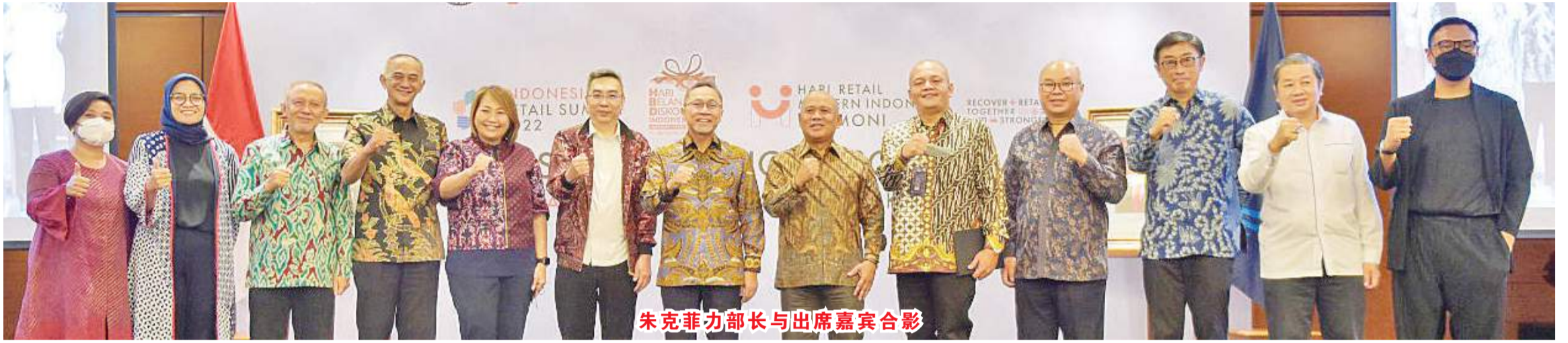
朱克菲力部长与出席嘉宾合影