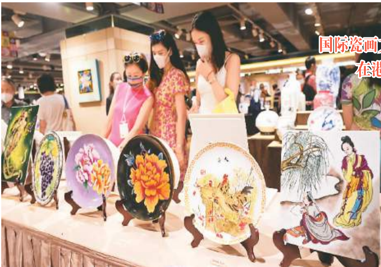
国际瓷画文化艺术节在港开幕

海旅会台北办事处还邀请了旅行社和旅游杂志等相关机构参展，方便向台湾民众讲解网络申办“台胞证”的流程，并进行旅游产品介绍，推广中华文化、历史典故等。