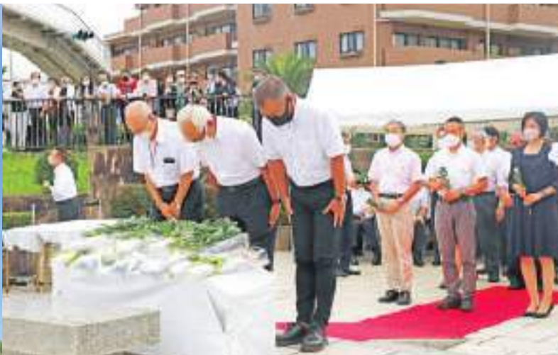
聂耳遇难87周年纪念活动在日本藤泽市举行 7月17日,在日本神奈川县藤泽市的聂耳纪念馆,日本民众在聂耳纪念碑前献花并鞠躬。17日上午,在日本神奈川县藤泽市海边的聂耳纪念馆广场上,庄严的《义勇军进行曲》再次被奏响。近百名中日友好人士向聂耳纪念碑献花,共同缅怀87年前不幸溺水遇难的中华人民共和国国歌作曲者聂耳。