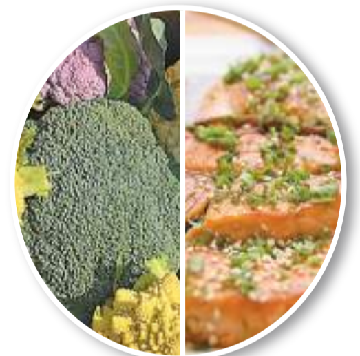
以魚肉代替紅肉、多吃十字花科蔬菜，有助避免誘發乳癌的生成。

世界各地不同種族的婦女患乳癌的風險都不一樣，根據香港乳癌研究結果及其他研究實證，癌症事務統籌委員會轄下的癌症預防及普查專家工作小組修訂了本地華裔婦女的乳癌篩查建議，年齡介乎44至69歲而有某些個人化乳癌風險因素的婦女，應考慮每一至兩年接受一次乳房X光造影篩查。戴醫生補充：「市民可參考政府癌症網上資源中心的乳癌風險評估工具(cancer.gov.hk/tc/bctool/index.html)，如果懷疑有乳癌的症狀，就應盡快求醫，作出詳盡的檢查。」定期作檢查，注意飲食均衡，養成規律的運動習慣，適時釋放身心壓力，讓身體更健康，自然能遠離惡疾。