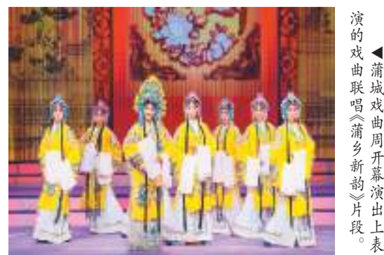
蒲城戏曲周开幕演出上演的戏曲唱腔《蒲乡新韵》片段

运城古称“河东”,是中华民族和中华文明的重要发祥地之一。运城戏剧文化源远流长,素有“戏曲之乡”的美称。蒲剧,是运城独具特色的文化符号,也是承载河东文化的亮丽名片。首届蒲剧艺术周以“传承优秀传统文化,促进蒲剧繁荣发展”为主题,举办了蒲剧艺术电视专题展播、蒲剧发展史展览、蒲剧传承发展研讨会、王艺华和景雪雯蒲剧艺术传承专场、蒲剧青年新秀演出专场、“蒲苑芬芳”交流展演等精彩活动,集中展示蒲剧艺术传承发展盛况,为人民群众献上了一场精品荟萃、异彩纷呈的蒲剧艺术盛宴。