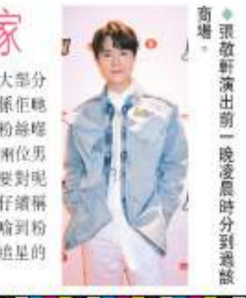
張敬軒演出前一晚凌晨時分到該商場。

愛》，心情緊張到好似生仔一樣，始終他對音樂的要求很高。軒仔又自爆演出前一晚凌晨三點曾到過該商場，他說：「因為我知道有好多粉絲通宵排隊等派籌，喇個時間我啱啱收工，趁住喇個時間我啱啱返屋企，我好開心大家嚟支持我，令我體會到新一代追星方法同以前唔同，其實我最擔心係佢哋唔安全，因為大部分粉絲都係十幾歲，如果我係佢哋老實會教訓佢哋。之前有粉絲囑ig度DM(私信)我話有一兩位男士曾經觸碰佢哋身體，我要對呢兩位男士作出警告。」軒仔續稱明白單憑幾句說話未必能嚇到粉絲乖乖回家，但希望他們追星的時候都要注重安全。