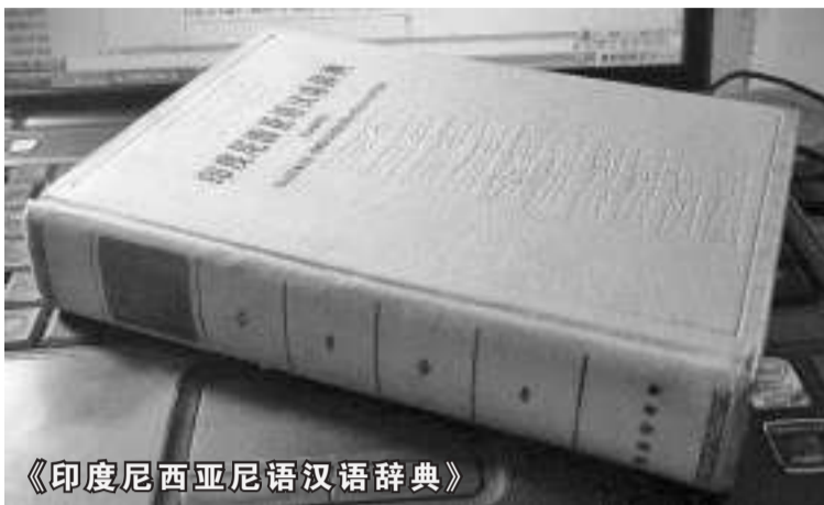
《印度尼西亚语汉语辞典》

现在每当我双手敲打着电脑键盘,轻松自如地输入资料和修改文章的时候,就会想起当时的父亲,想起他怎么可能在那样原始的条件下,只