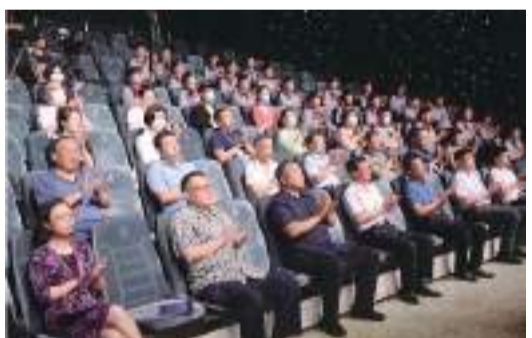
6月30日至7月1日，首屆華東地區暨全國部分省市旅游電視歌曲大賽在青島進行

推優總評審。本次大賽共徵集全國各地報送作品一千餘首，由各地進行初選，并推選優秀作品匯集在青島進行總決賽。7月2日，在青島廣播電視臺舉行首屆旅游電視歌曲大賽頒獎晚會。大賽旨在搭建一個高端平臺來展示豐富的文化底蘊和豐盛資源以及優美的旅游環境，使旅游經濟更加藝術化、國際化、品牌化。