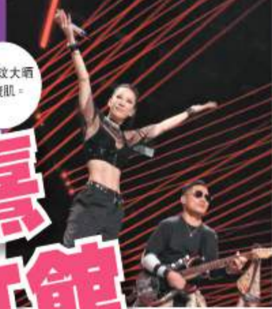
李玟晒曬肌肉展現腹肌。

有一天能站上紅館舞台：「幾個月的相處，但回憶是一輩子的，我希望我們下次相遇，是在紅館的演唱會！」Gigi則指自己經常向千嬅老師問問題，而千嬅則會每一條都用心回答，並會於Gigi每次出場前提醒她放鬆和送上「愛的抱抱」。是集更曝光了千嬅隊長的一面，千嬅隊成員將逐個在鏡頭前訴說對千嬅隊長的爱，更會輪流暢談千嬅高心位。