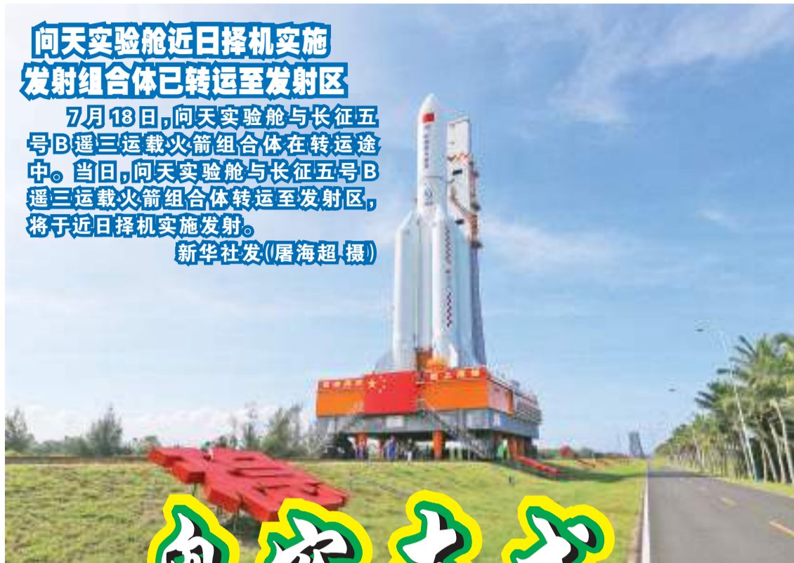
向天实验舱近日择机实施 发射组合体已转运至发射区 7月18日,向天实验舱与长征五号B遥三运载火箭组合体在转运途中。当日,向天实验舱与长征五号B遥三运载火箭组合体转运至发射区,将于近日择机实施发射。