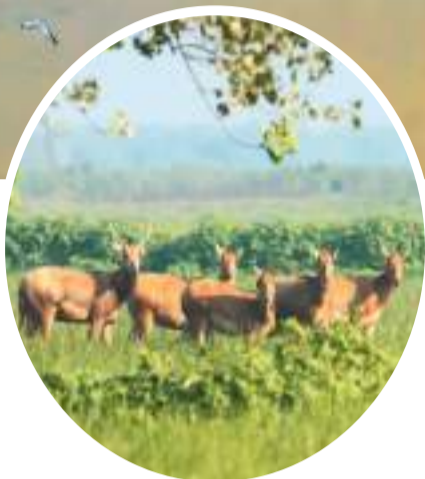
洞庭湖岸上的麋鹿。

也许是神兽命不该绝，当时英国有个特别喜欢鹿科动物的人士十一世贝福特公爵。他花重金将分散饲养在巴黎、柏林、科林、安特卫普等动物园的麋鹿共18头全部买下，放养在伦敦北一