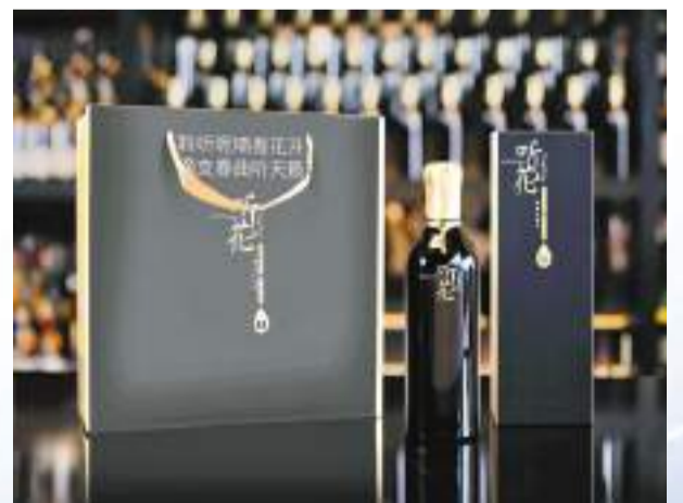
聽花醬香風格白酒標準

業內專家表示，聽花酒扛起了中國白酒健康化大旗。兩位諾獎得主成為聽花酒聯席首席科學家，白酒「減害增益」從理論到技術將取得更好發展，是中國白酒和消費者的福音。世界頂級科學家參與中國白酒健康化研究，將促使白酒健康化時代更快的到來，並將真正推動中國白酒走出國門、走向世界。