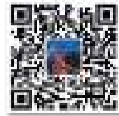
青島發佈 官方微博二維碼