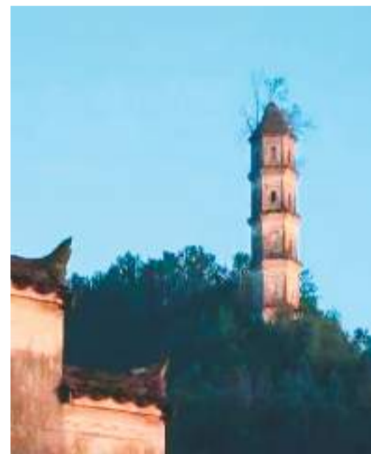
休宁的塔。

水面愈加开阔，汶溪从汶溪桥下穿越而过，成了一条绸带。再瞧，玉几山的东翼又现一塔，与西侧的丁峰塔隔山相望。此塔称为巽峰塔，同是楼阁式砖结构，八角七层，高35米。内置168级盘旋台阶，可达