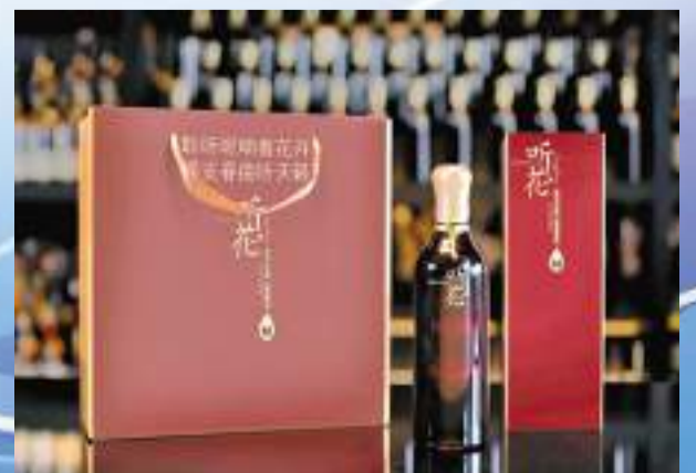
聽花濃香風格白酒標準