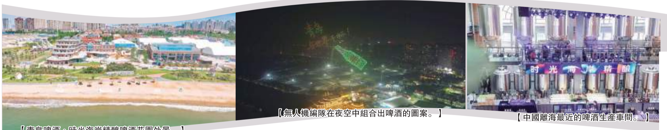
【青島啤酒·時光海岸精釀啤酒花園外景。】

自助打酒、旅游、婚慶、時尚IP等融為一體。依托這一全新業態，青島啤酒將不斷滿足、引領和挖掘消費者高端化、個性化、場景化等多元需求，在產業升級引領、啤酒文化傳播等方面加速創新驅動，打造展示青島城市風貌、匯聚人流商機的會客廳，把每年夏天的啤酒狂歡變為一年四季“永不落幕的啤酒節”。這一顛覆性的創新方式，必將成為啤酒與時尚文旅相結合的商業模式典範，引領“啤酒+文旅”的產業融合新紀元。(周曉峰)