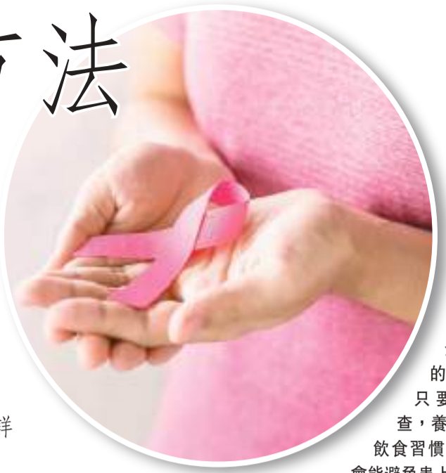
乳癌是全球常見的癌症，但只要恒常檢查，養成健康的飲食習慣，很大機會能避免患上惡疾。