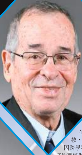
亞利耶·瓦謝爾（Arieh Warshel） 2013年「諾貝爾化學獎」獲得者