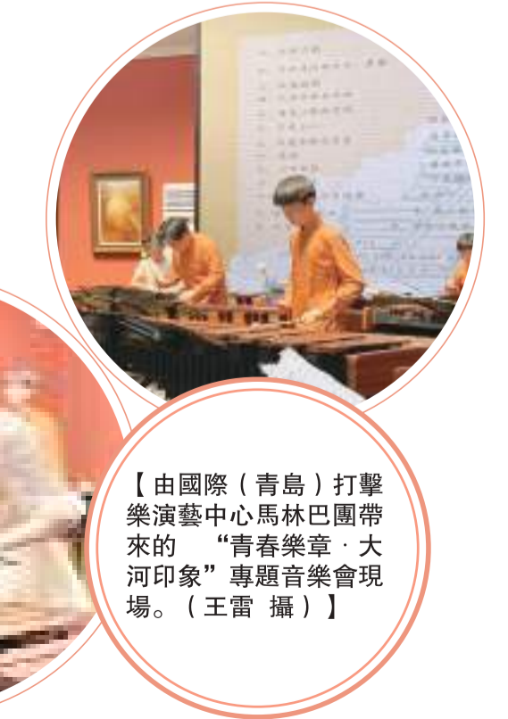
【由國際（青島）打擊樂演藝中心馬林巴團帶來的“青春樂章·大河印象”專題音樂會現場。】