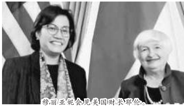
穆丽亚妮会见美国财长耶伦。

【本报讯】财政部部长穆丽亚妮坦言，印度尼西亚卷入1997-1998年和2008-2009年金融危机的经历成为财政政策的决定因素，以更好地适应宏观经济冲击。因此，从危机的两次经历中，印度尼西亚能够经受住冲击。 财长穆丽亚妮周五(15/7)在题为《宏观经济政策组合促进稳定和复苏》的研讨会上指出，自1997年至1998年以来，我国能够应对逆周期，并被许多国家效仿。包括发展中国家，以试图应对由于全球冲击或2008-2009年金融危机而产生的周期性波动。 出席此次研讨会的还有美国财政部部长珍妮特·耶伦等。 穆丽亚妮表示，当时发生的金融危机也使世界大宗商品价格飙升，但印度尼西亚作为生产这些商品的国家，获得了“天上掉下的馅饼”装进国家的财政。因为印度尼西亚是一个自然资源丰富的国家，所以我们享