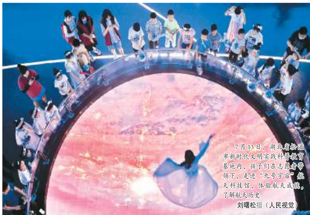
7月13日，湖北省松滋市新时代文明实践科普教育基地内，孩子们在志愿者带领下，走进“九号宇宙”航天科技馆，体验航天成就，了解航天历史。

7月11日是辽宁省朝阳市中小学暑假的第一天。龙城区区长江路第一小学的家长和孩子不用在烈日炎炎之下奔