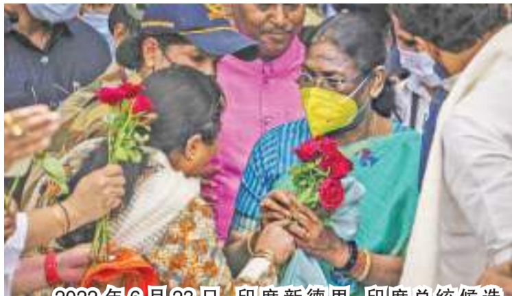
2022年6月23日,印度新德里,印度总统候选人莫尔穆抵达机场,受到印度人民党的欢迎。

中新网7月18日电 2022年印度总统选举于7月18日举行。虽然印度总统是虚位元首,但此次选举的重要性仍不可小觑。舆论普遍认为,本次印度执政联盟推选的莫尔穆有很大胜率,若她顺利当选,印度将迎来第二位女总统,也是第一位出身部落地区的总统。