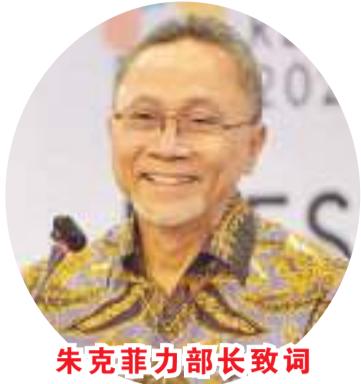
朱克菲力部长致词