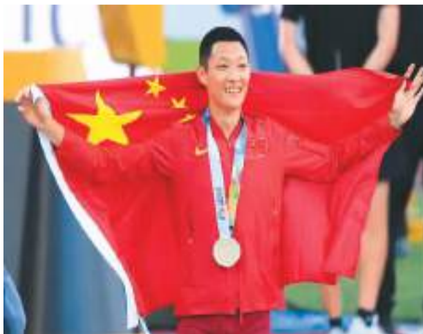
王嘉男在比赛中试跳。 王嘉男在夺冠后庆祝。