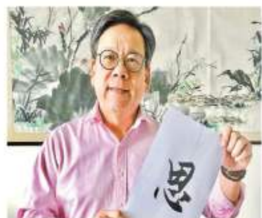
商務及經濟發展局局長丘應樺以一個「思」字鼓勵應考學生「慎思明辨」。

丘應樺就以一個「思」字鼓勵應考學生，「思」有「思考」、「構思」、「心思」等含意。無論什麼情況，「慎思」都是非常重要。「學而不思則罔，思而不學則殆」，讀書固然重要，但學習過程中，都要多加思考，明白道理。他鼓勵考生只要「慎思明辨」，