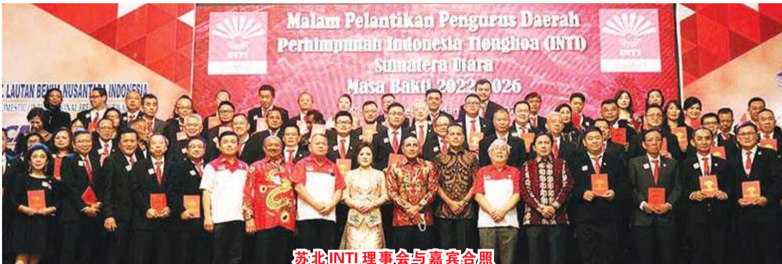
苏北INTI 理事会与嘉宾合照