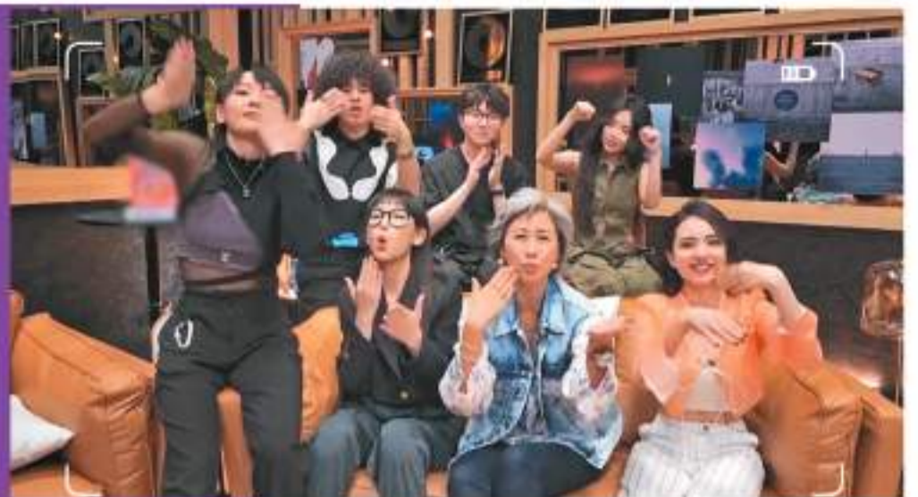
《聲生不息》團隊打成一片，感情要好。