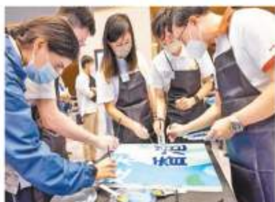
行政長官李家超與年輕人攜手繪畫，希望大家可以一起建設香港未來。

在活動期間，麥美娟與年輕人交流互動，感受到他們的活力、創造力及潛力，局方並引述麥美娟說，青年人是香港的水及希望，新一屆政府十分重視青年發展，民青局將推動更多青年發展工作，與社會各界攜手培育青年的正向思維，鼓勵青年人共同為香港和國家建設更美好的未來。