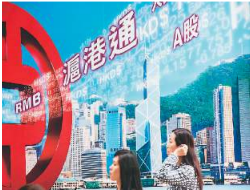
前走。香港市民从香港中环一家银行的沪港通广告牌前走过。

外拓展业务，涉及资金的调拨和管理，香港可以为其提供管理服务。香港还可以作为风险管理中心，协助内地企业面对在海外拓展可能面临的风险。