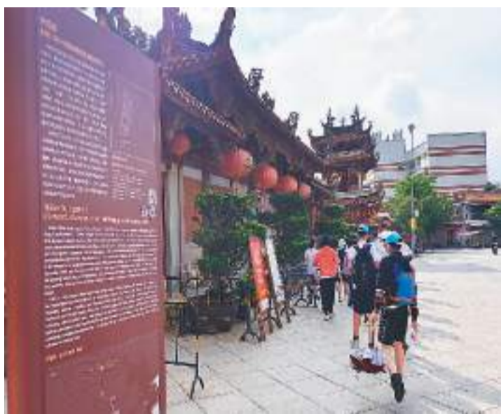
2022年7月，泉州申遗成功一周年到来之际，参加国学夏令营的中学生正在排队进入泉州天后宫遗址参观。

与对外通商历史悠久的广州港相比，泉州港表面上似乎并无任何优势。但是福建比之广东，却相对开发得更早、更全面。整个北宋年间，福建登科的进士人数是广东的十多倍，这在一定程度上反映了经济发展水平。泉州及其腹地为了海外贸易而生产多种商品，但对于广州港来说，有许多则需从外省调运才能获得，这无疑加大了广州港的贸易成本。在泉州，为了适应海洋生计模式，种植粮食的土地改为种植经济作物，比如荔枝、龙眼、茶叶、甘蔗和木棉；烧瓷的窑