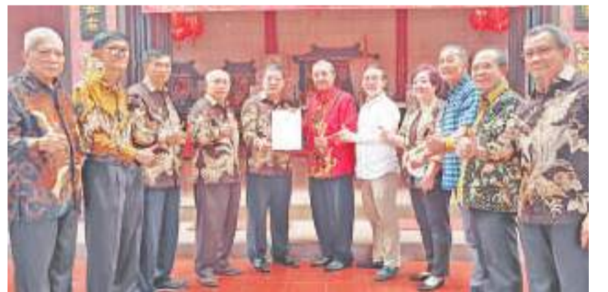
辅导团成员见证颁发聘书