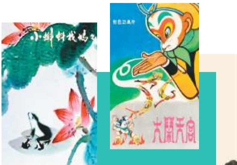
▲从左至右依次为《小蝌蚪找妈妈》《大闹天宫》《牧笛》

100年来,中国动画始终以民族化为基础,进行着“走出去”的努力。1942年,万氏兄弟的《铁扇公主》在亚洲上映,引起轰动。20世纪50年代至80年代末,以上海美术电影制片厂为主创作出的《小蝌蚪找妈妈》《大闹天宫》《哪吒闹海》等一大批优秀动画,频繁在国际上参展并摘得奖项,收获“中国学派”美名。此后一段时间,中国动画在精进技艺、熟悉国际动画制作流程的过程中等待“破茧成蝶”。新世纪尤其是党的十八大以来,在发展动画产业以及一系列促进中国文化“走出去”的利好政策中,众多动画企业扬帆出海,以动画为媒介,与他国进行互动交流,传播魅力中国。