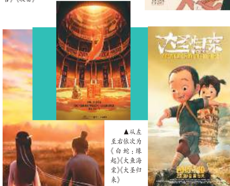
▲从左至右依次为《白蛇:缘起》《大鱼海棠》《大圣归来》

在这方面,“动漫之都”杭州表现亮眼。中国国际动漫节通过连续10年参展法国戛纳,成功引进法国戛纳电视节这项国际影视内容产业的第一品牌,在杭州举办亚洲专场。至2021年,已连续5年成功举办的戛纳电视节中国(杭州)国际电视内容高峰论坛(MIP China),有效开阔了中国影视动漫企业的国际化视野,拓宽了国际合作交易渠道,增进了中外合作的机会,推动了以中国影视动漫作品“走出去”。2020年,以网易雷火和电魂网络为代表的杭州动漫游戏服务