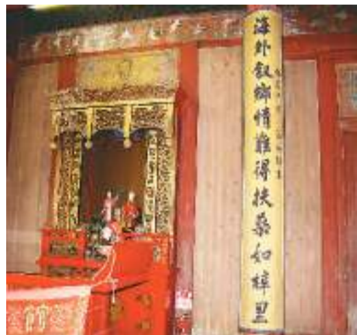
左图：日本长崎的福建会馆始建于1868年。会馆内的天后堂，也供奉着妈祖。

“船”在泉州历史文化中占有重要地位。2008年7月，在泉州石狮祥芝镇斗美宫展出一艘“迷你”王船。“送王船”是闽南地区一种祈求平安、赶走瘟疫的仪式，与福船造型几乎一模一样。完成仪式后，王船会被送入大海或在海边焚烧。“送王船”仪式随着闽南人的脚步传到东南亚和日本长崎，2020年成为世界非物质文化遗产。