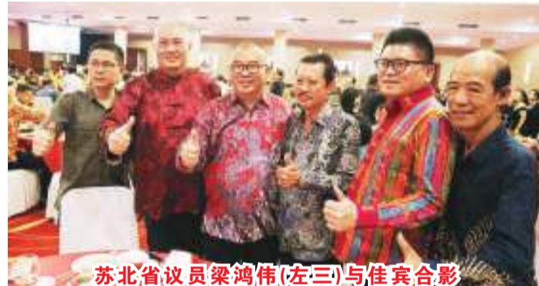
苏北省议员梁鸿伟(左三)与嘉宾合影