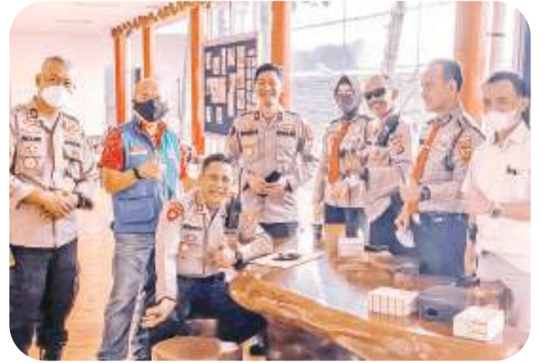
警察局卫生部警官在茶座边小憩

【万隆讯】7月14日，万隆华族关怀团队(MTP)和万隆大警察局(Polresta-Bandung)合作举办接种加强剂疫苗活动并由印华百家姓协会西瓜哇分会同仁(PSMTI Jabar)主办，地点在万隆渤良安福利基金会(YDSP)会所百氏祠进行。