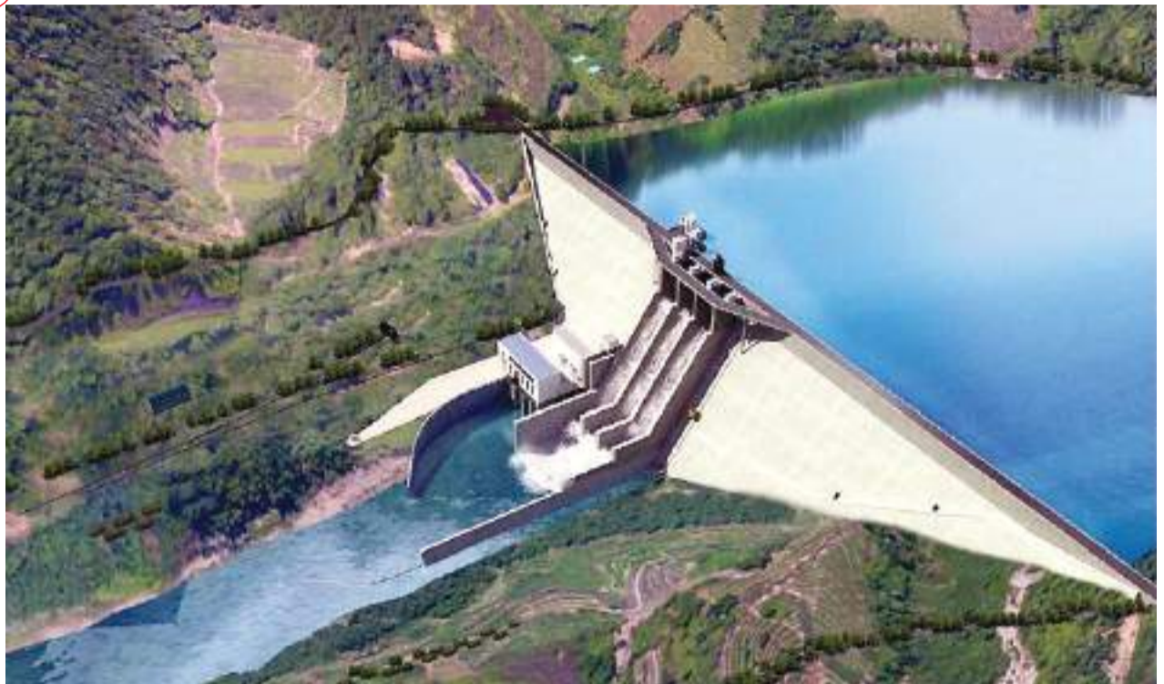
福州重大水利民生項目——“一庫兩綫”工程提上議事日程,開啓前期規劃論證。

據福州市水利部門介紹,“一庫兩綫”工程,將開發利用大樟溪優質水源,建設大型龍湖水庫和兩條輸水綫路,將向福州主城區和濱海新城、東南科學城(含大學城)提供充足的優質水,受益人口近400萬。