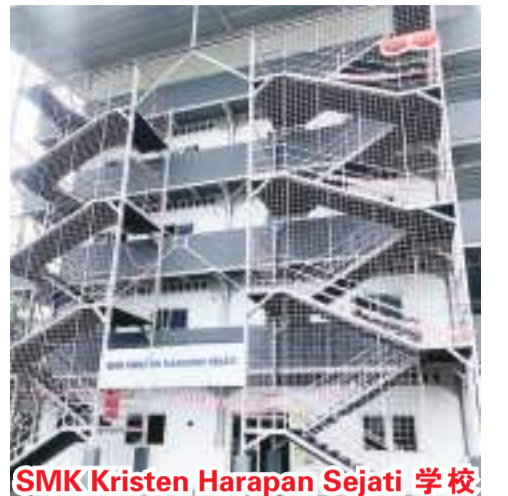
SMK Kristen, Harapan Sejati 学校