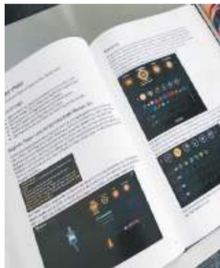
海外用户为国产游戏《古剑奇谭》制作的纸质版攻略。资料图片

业内人士指出，技术进步和文化交融拉近了全球游戏爱好者的距离，也催生了更为多元化的需求。中国游戏厂商不仅要为海外市场进行深入研究、及时洞察目标群体偏好变化，更要从产品研发之初就做好立足全球的准备，以稳定的产品品质积累忠实用户，迈向从单一爆款升级成全球IP的征程。