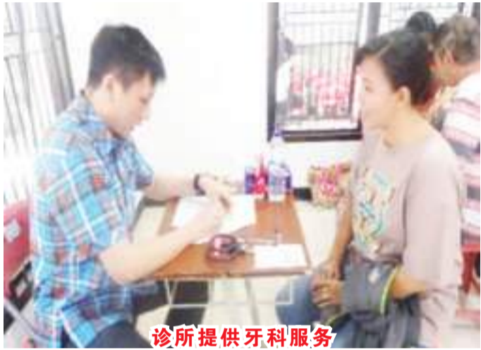
诊所提供牙科服务

多年来,基金会不仅在当地贫困区域默默扶持教育医疗方面,扶持村落项目更是扩大到中爪哇及整个印尼地区,如在中爪哇 Gunung Kidul 区建立香茅油精炼厂、Lawang Gunung Palu 村为当地教堂发电、古邦创建 Panduga 高中、为 Kelud 和 Semeru 火山喷发受害者提供经济援助等。本报记者叶露