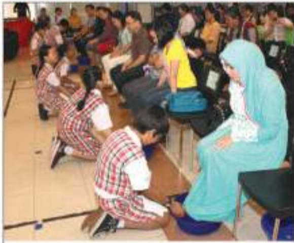
小学部孝亲节活动-子女为父母洗脚

道德教育以及品格培养旨在使学生在步入社会后能够成为德才兼备的人。具有同理心,感恩、尊重、爱成为八华道德教育的核心价值观。