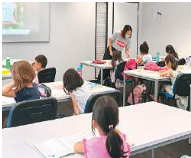
德国杜塞尔多夫汉园中文学校小班课的学生在上课。

曾经从事汉语国际教育的我目前在德国杜塞尔多夫汉园中文学校从事海外华文教育工作。在不到3年的教学工作中，我切实地体会到了海外华文教育和汉语国际教育的不同。曾有朋友对我说：“不都是教中文吗？能有什么不同！”他只说对了一半。确实，海外华文教育和汉语国际教育都是中文教学，有一定共性，但两者并不能混为一谈。