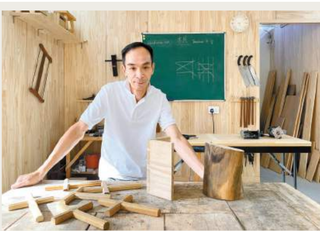
輝師傅把香港仔一間教會的陳年祈禱椅拆散，製作成一個個十字架，送給教友掛在家中。

特區政府宣布爭取2050年前實現碳中和的目標，香港三大碳排放源依次是發電、運輸和廢棄物。要達至「全民減廢」，不論政府、企業，還是個人都必須參與。從個人角度，要盡量不浪費、節省食品和用品，一些環保人士的超級減碳生活非一般人能仿效，但有些經驗和做法卻是人人都可學習及借鑑。本報將系列報道一些常人能做到的節約模式，並可成為潮流，令人人都能輕易助力香港實現「碳中和」。 香港商報記者 李銘欣