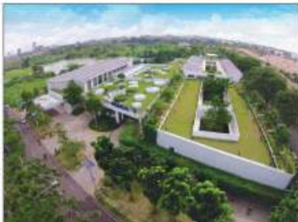
八华幼儿园荣获国际环保建筑设计大奖