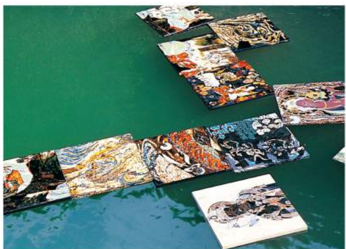
《漂泊在水中的莫高窟》