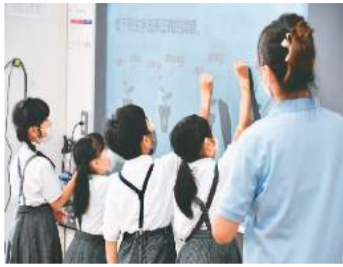
日本横滨山手中华学校小学一年级学生在学习汉语拼音。

第四，从海外华文学校层面来说，需要营造校园中文环境。作为连接华裔学生、家长、教师的平台和纽带，学校应有意识将中文作为校园交际语言。在具体操作层面上，比如可以通过中华文化活动推动语言生活，因为学习中文不仅是在课堂上学习语言知识、获得语言技能，更重要