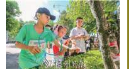
短距離3.5MHz個人賽，選手們手持無線電設備快速尋找着“獵物”。