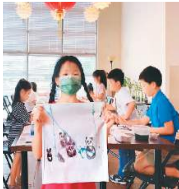
美国亚特兰大童心中华文化学校中华传统文化课上，学生在展示作品。

但再好的教学理念只有得到学生和家长的认可，才能发挥效用。如果家长不积极，孩子的中文学习积极性也会受影响。以美国为例，不少学校开展“国际夜”等展示不同国家文化和饮食的活动，这正是中文学校展示自己的机会。笔者还记得当年童心中华文化学校的国学艺术团出现在活动现场时，学生家长很是自豪，这也反过来让其更支持孩子的