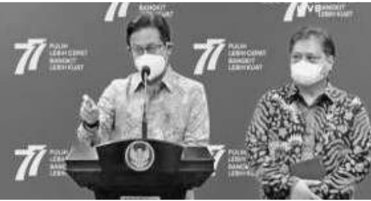
卫生部长古纳迪(左)在经济统筹部长艾朗卡陪同下传达佐科维总统的指示

【本报讯】卫生部长古纳迪在周二(23/8)的新闻发布会上表示，曾收到佐科维总统的指示，目前正在