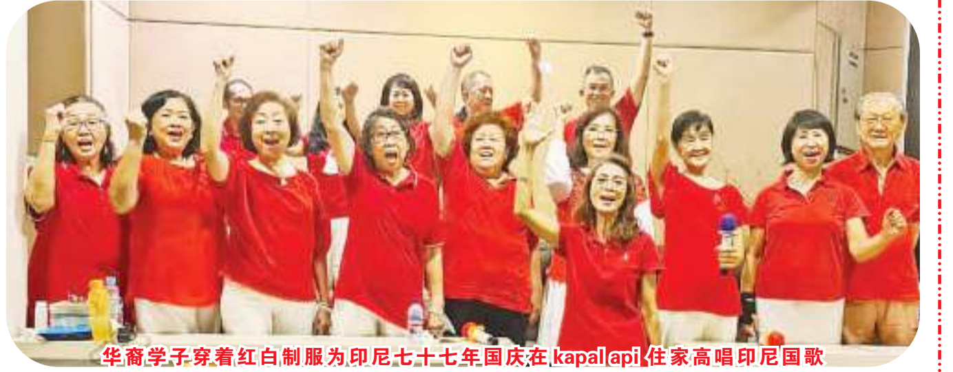
华裔学子穿着红白制服为印尼七十七年国庆在 kapal api 住家高唱印尼国歌

去了国家观念,受到崇洋媚外的灌输很深,尤其是一些华侨子弟们,想起来非常的痛心。今年在英明的佐科总统领导下,举行了比以往更特别的隆重仪式,使我们这些曾受过华文教育的学子都感慨万千,在各自领域里也不甘示弱地举行简单且有意义的国庆仪式。当唱起了好几年不曾唱过的国歌,个个都热泪盈满,激情地握起拳头高举“merdeka!merdeka!” 吴夏兰