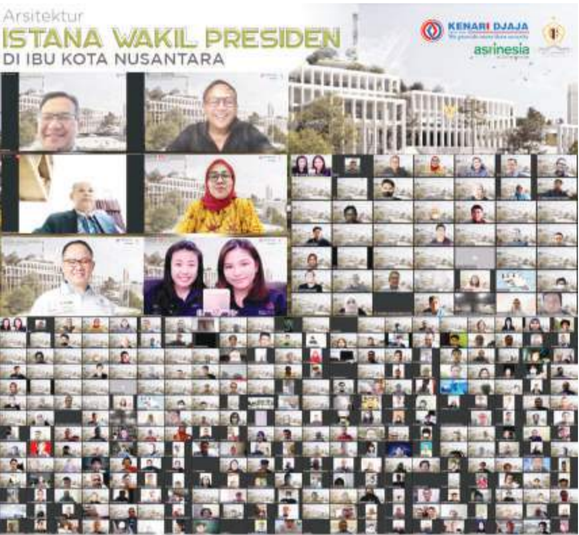
发言人和研讨会参与者及建筑竞赛获奖者的设计作品