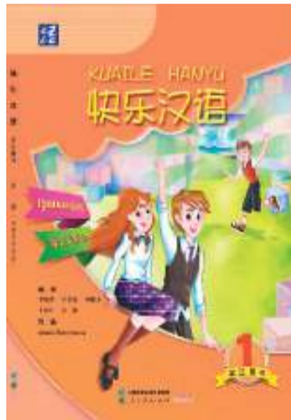
图为《快乐汉语》（亚美尼亚语版）教材封面。