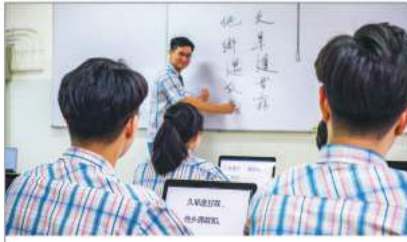
强化而高效的中文课堂教学

八华学校是提供语言教学以及道德教育的首倡学校,学校分别开设印尼文、中文以及英文三种语言课程。学校拥有强大的中英文外教师资团队支持专业教学,不仅要求学生掌握良好的语言能力,而且要求学生能够用精准的语言来进行沟通与交流,从小提升学生的国际竞争力。