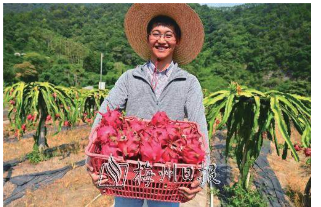
村民正在採收火龍果。