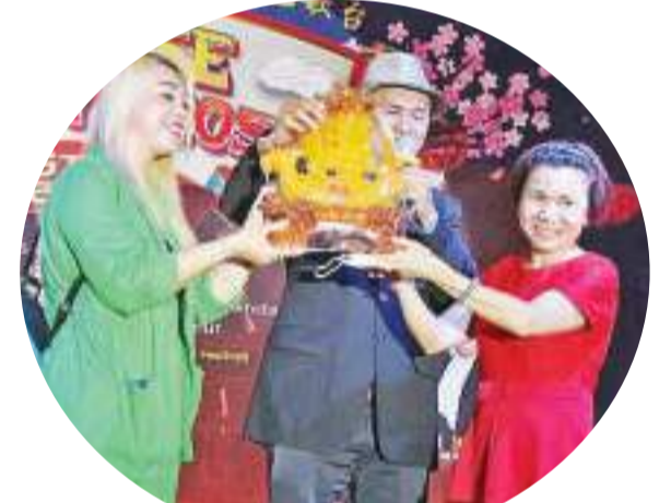
慈善家接领「一帆风顺」艺术品