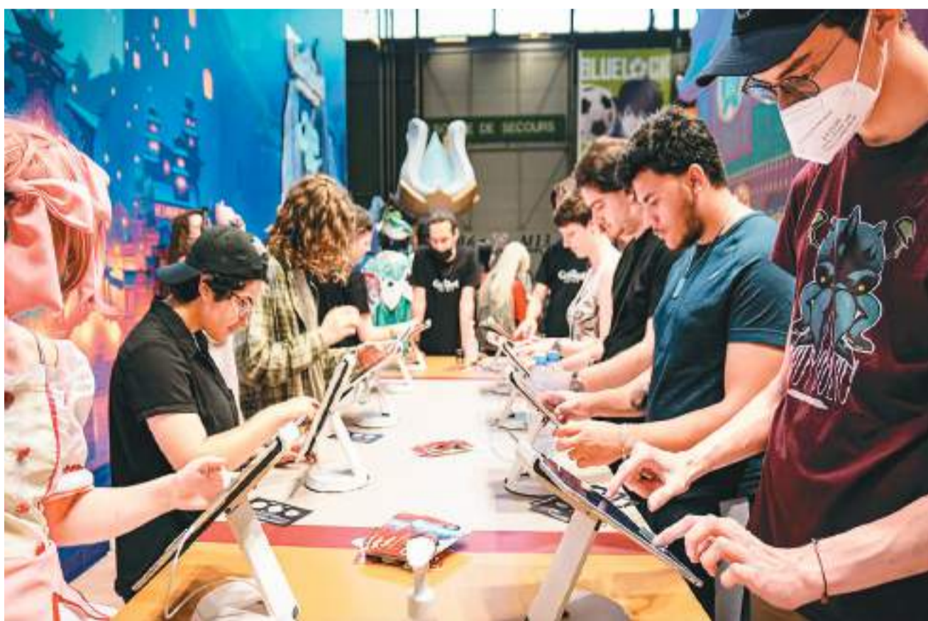
今年7月在法国巴黎举办的综合性动漫展Japan Expo上，国产游戏《原神》展台前吸引众多游戏爱好者。