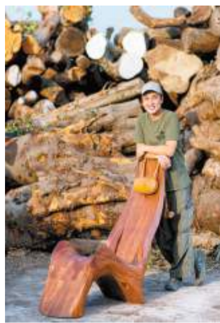
「香港木庫」是全港最大的樹木回收商。

每逢颶風過後，路邊都有大量塌樹，消防員或政府工人會簡單地將之鋸開數截放在路邊，以盡快恢復交通為首要工作。非緊急情況一般要一星期甚至幾個月，才能把塌樹全部清走，而這些樹木的歸宿，很多時都是堆填區。社會仍有不少和輝師傅一樣的有心人本以「救得幾多得幾多」心態，將樹木回收處理好後，再分派給學員製作家具，為社區樹木賦予「第二生命」。