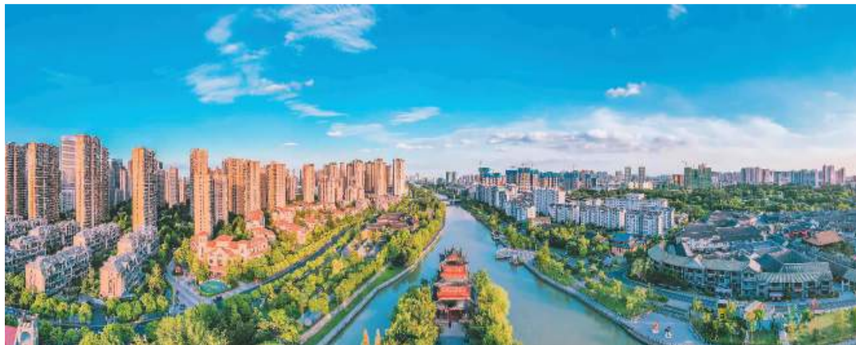
8月24日, 江苏省淮安市里运河文化长廊两岸景色宜人。淮安里运河贯穿淮安东西, 全长32公里, 沿岸风景优美、人文景点众多, 国家级、省级及市级文物保护单位百余处, 承载着淮安千年的运河文化, 见证了昔日淮安漕运文化的兴盛, 是淮安人的母亲河、文化河。如今, 里运河已被当地打造成一条文化长廊。

水运规划体系不断完善。积极开展全国港口与航道布局方案研究, 谋划全国水运设施发展的顶层设计。落实国家重大区域战略要求, 编制实施沿海邮轮港口布局规划、琼州海峡客滚滚装港口布局规划等专项规划。落实国家五年规划和综合交通五年规划有关要求, 印发实施水运“十三五”、“十四五”发展规划以及配套文件, 建立了“五年规划库、三年滚动库、1年计划库”重大项目库滚动实施机制。