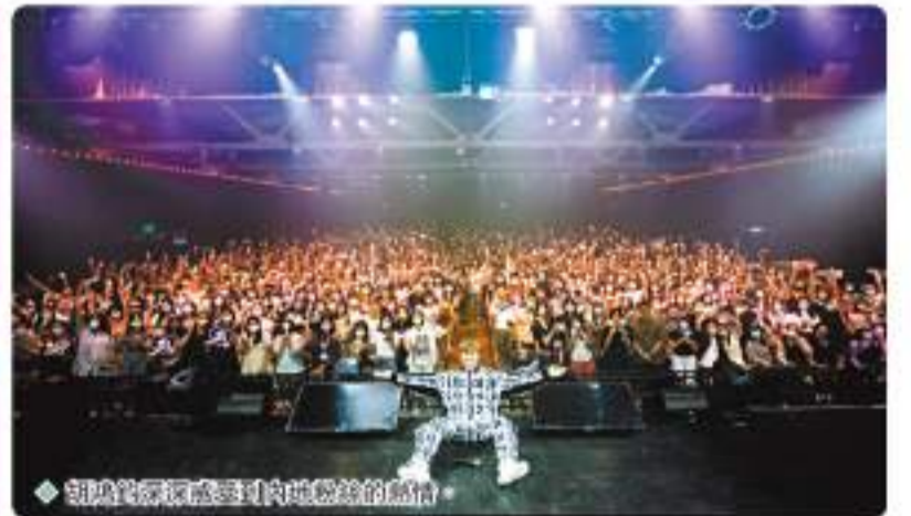
胡鴻鈞巡唱感受內地歌迷的熱情。