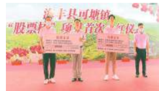
可塘鎮荔枝樹變身「股票樹」首次分紅現場。

荒地「活」起來，大力探索、推廣村民自行承包土地、對外承租、村聯社統籌、村聯社與公司合作等四種模式。