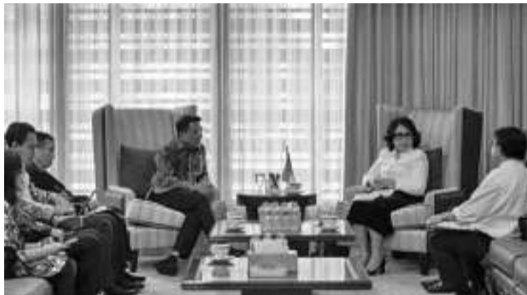
地方自立粮食安全系统至关重要

保持质量的可用性,并实施热爱、自豪、理解盾币的教育计划,包括2022年的盾币教育。(亮剑)