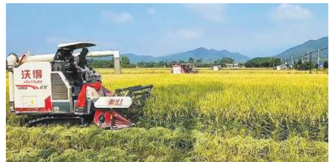
公平鎮塑造水田項目喜獲豐收。

可塘鎮因地制宜推動荔枝林「股票樹」經濟活水長流。鎮黨委不斷優化項目計劃，創新性地提出「股票樹」模式，打破項目運轉僵局。村組兩級充分發揮基層黨組織「橋頭堡」作用，推進「創新荔枝產業」項目落地實施，並通過「返鄉走親」等方式協助村委會向村民宣傳講解項目優勢。黃光鎮着力打造「黨組織+公司+基地+農戶」「黨組織+合作社+農戶」模式，發展金針菜特色示範基地擴種和金針菜加工項目，構建現代農業生產體系。該鎮還想方設法讓閑置摺