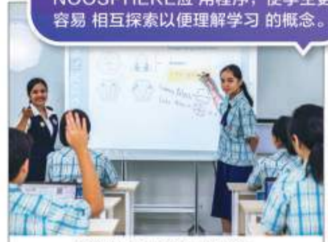
学生使用NOOSPHERE进行小组圆桌讨论解决问题。

为了优化教学过程,八华学校使用NOOSPHERE应用程序,使学生更容易相互探索以理解学习的概念。