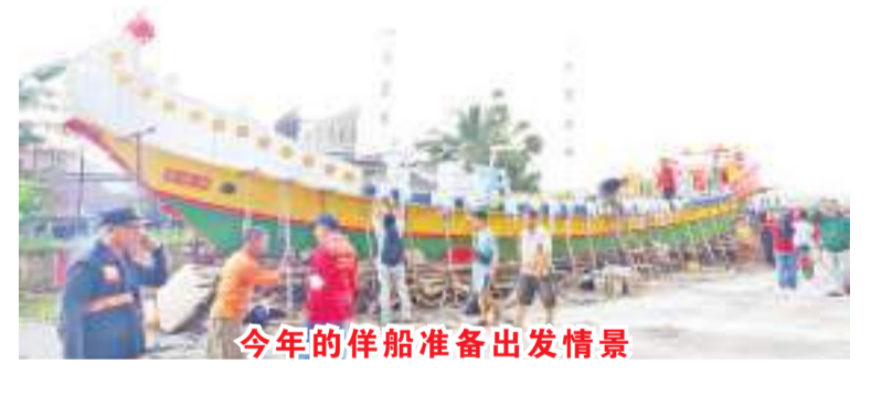
今年的伴船准备出发情景

2022 年 8 月 12 日(星期五)早上,西加孔教华社总会理事们在罗俊丰总主席与孟兰盛会筹委会主席杨汉城的陪同下假座该会议冢前的大广场主持秋祭,结束今年的秋祭活动,中午两点开始在广场上举行孟兰胜会的抢孤与烧伴船活动,这也是疫情后循例的首次公开活动,前来参加的民众比往年少的多,经过一系列祭拜仪式后,抢孤开始,接着就要烧伴船的时候,突然乌云密布并下大雨,但全体理事们不受大雨倾盆的影响,顺利吧伴船烧的一干二净,圆满结束后才返道回家。史帝芬报道