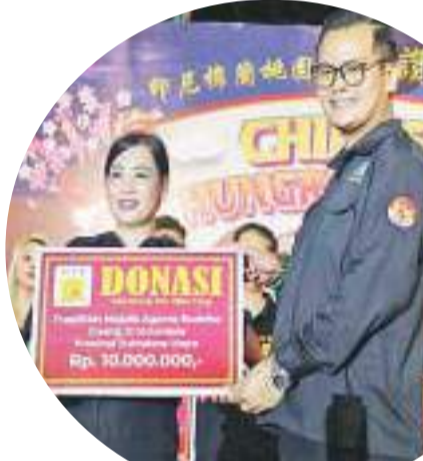
印尼广济佛教议会代表接领捐款

Sungai Air Hidup, Puskdiklat-Majelis Agama Buddha Guangli (广济)Indonesia, Lion Club Medan chakra Cancer anak& Mata Katarak。最后在头瑞狮狂舞后,焚化 Pho Tho Gong 而圆满结束。陈平治报道