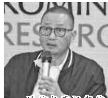
通信与资讯部信息学应用局长瑟姆尔

【本报讯】通信与资讯部正在调查IndiHome客户个人数据泄露的消息，这是国家电信公司(PT Telkom Indonesia)的一项服务。 通信与资讯部信息学应用局长瑟姆尔(Semuel A. Pangerapan)不久前在一份书面声明中表示，在社交媒体上传播说IndiHome 2600万客户搜索历史，以及客户的姓名和身份证登记号被泄露，并在非法网站上免费分发。关于IndiHome客户个人数据涉嫌泄露的信息，国家电信公司、通信与资讯部正在深化所谓的事件。 瑟姆尔表示，通信与资讯部将传唤国家电信公司管理层以获取与此事相关的报告和后续步骤。在获得国家电信公司的报告和步骤后，通信与资讯部将发布技术建议，并与国家网络和密码局(BSSN)协调。通信与资讯部将很快发布技术建议，以改善国家电信公司个人数据保护的实施，同时与国家网络和密码局协调。 (亮剑)