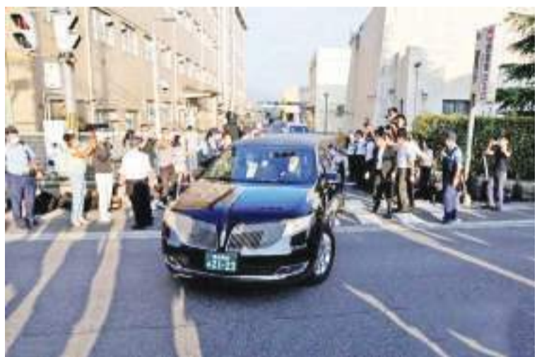
当地时间7月9日上午,一车队驶离奈良县立医科大学附属医院。据悉,车上载有日本前首相安倍晋三的遗体,遗体将在今天之内被送往东京。

中新网8月26日电 据日本共同社报道,日本政府26日在内阁会议上决定,关于9月27日实施