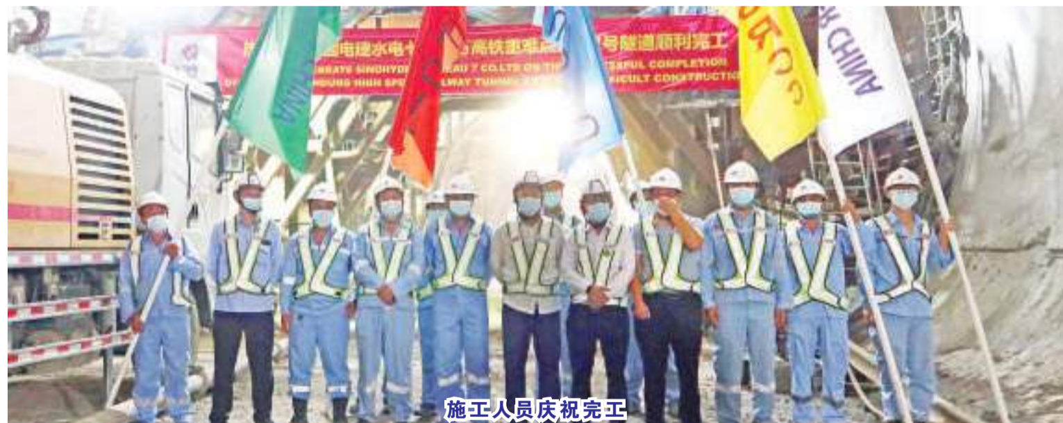
施工人员庆祝完工

中新社雅加达8月25日电(记者林永传)当地时间8月25日晚,随着最后一板衬砌浇筑完成,印尼雅万高铁2号隧道顺利完工,打通了雅万高铁全线架梁通道,为2023年6月全线建成通车奠定了坚实基础。