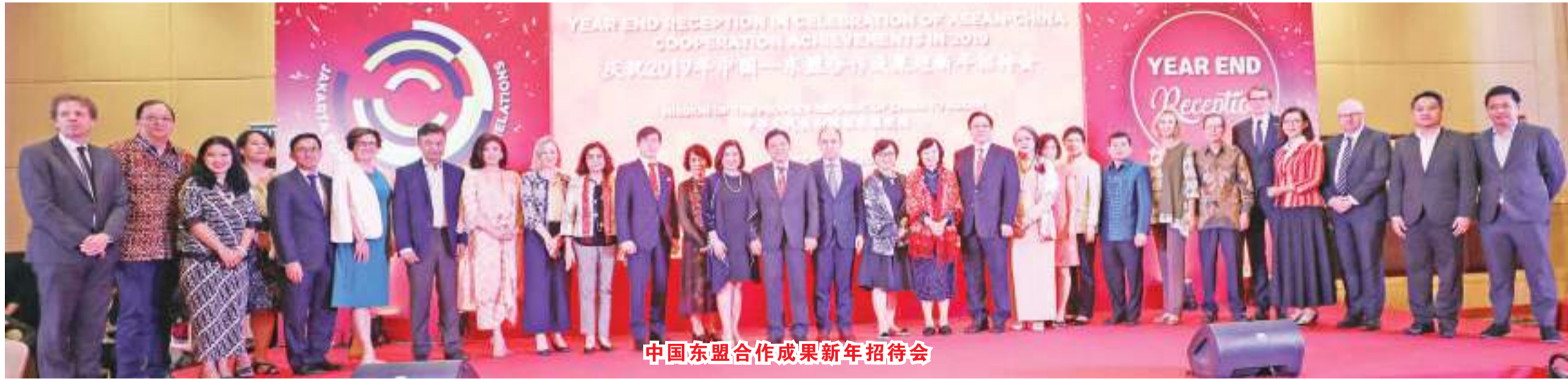
中国东盟合作成果新年招待会