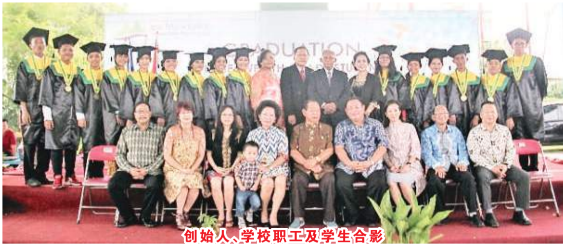
创始人、学校职工及学生合影