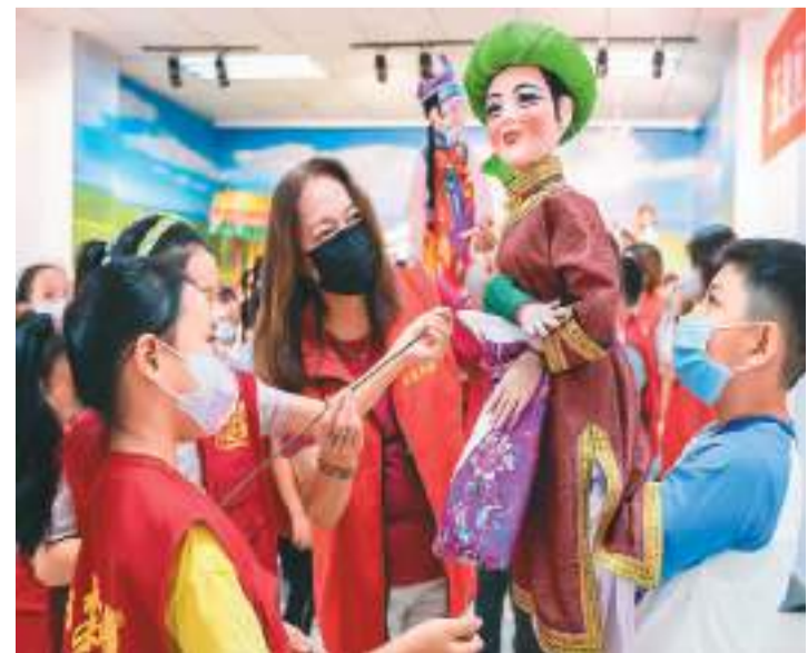
暑假期间,内蒙古自治区呼和浩特市玉泉区文化馆开设公益非遗课堂,教孩子们学习非遗杖头木偶戏的操纵表演技艺,让传统文化薪火相传。图为8月25日,木偶艺人在教孩子们操纵杖头木偶。