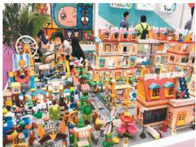
图为“第34届国际玩具及教育产品（深圳）展览会”展出的玩具产品。

“随着粤港澳大湾区发展，玩具产业可在湾区内外进行产业对接。”该负责人说，大湾区部分玩具企业把公司总部设在广东港，以获得信息、人才、金融、出口等便利；将生产加工程度设在东莞乃至内地其他省区，以获得当地的生产制造优势。此外，深莞港可分别在玩具研发、生产、品牌授权和推广等方面专业分工，大湾区不同城市优势互补，共同促进湾区玩具产业发展。