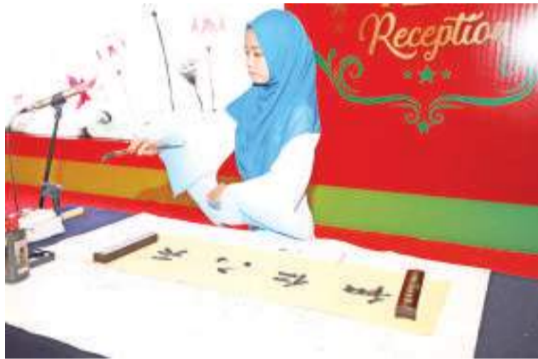
东盟学生表演中国书法

历史已经证明,儒家思想所倡导的相互尊重、相互信任、和谐共处的理念,是中国与东盟合作的基础和准则。如今,在推进全面战略合作伙伴关系和构建更加紧密的中国-东盟命运共同体进程中,儒家思想观点依然可以作为“法宝”。