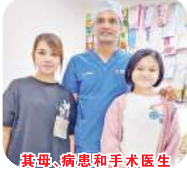
其母、病患和手术医生