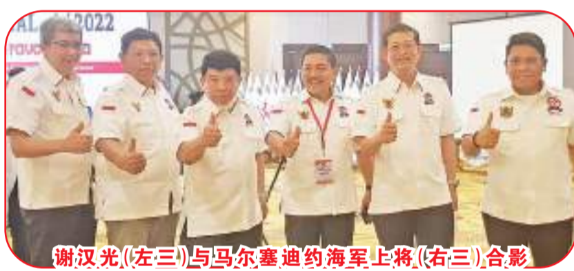
谢汉光(左三)与马尔塞迪约海军上将(右三)合影

国家发生粮荒,包括俄罗斯与向印尼以及几个国家提供小麦和肥料的乌克兰发生的战争。在世界动荡不定的形势下,印尼的经济基本面非常好,印尼经济也持续向好,他介绍说,印尼必须保持警惕和谨慎。