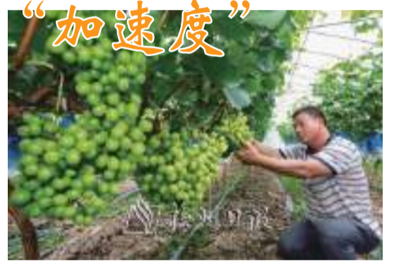
大埔縣西河鎮北塘村引進葡萄種植特色產業，開辟村民增收新渠道，夯實鄉村振興產業基礎。