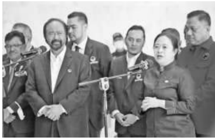
普安(右二)会见巴洛(左二)时情景

【本报讯】印尼斗争民主党强劲的政治游说之旅的策略，有可能在2024年大选之前改变国内政治动向。由梅加瓦蒂领导的政党不仅两次赢得选举，还可以推举自己的正副总统候选人，并拥有具有高度可选举性的潜在人物。正是由于这个政治资本，使印尼斗争民主党的举动始终受到其他政党的期待。 印尼斗争民主党于8月22日(周一)开始了一系列政治游说之旅。政治游说之旅始于印尼斗争民主党中央理事会政治和安全事务主席普安对民主民族党主席巴洛的访问。根据计划，印尼斗争民主党还将在为期两个月的政治游说之旅中与其他政党会面。 印尼斗争民主党主席梅加瓦蒂承认，命令普安与其他政党建立政治沟通。考虑的是，普安是印尼斗争民主党其中一位中央理事会主席，也是现任国会议长。梅加瓦蒂发现，普安的政治游说之旅引起了其他政党和政治精英的反应。事实上，印尼斗争民主党只会见过一个政党，即民族民主党。 作为一名资深政治家，梅加瓦蒂强调，在印尼斗争民主党与民族民主党会面后，可以发现情况出现变化。周三(24/8)，在第六波新党办公室启用典礼上发表讲话时，梅加瓦蒂表示，我发现到了，我的眼光积累了丰富的经验，就是从政治的角度来看，我也可以发现了一个政党而已。不仅是与民族民主党，根据计划，印尼斗争民主党还将与大印尼行动党、从业党、民族复兴党、国民使命党和团结建设党等领导人会面。 印尼斗争民主党副秘书长阿迪安多(Utut Adianto)周四(25/8)表示，政治游说之旅的目标是在两个月内完成。所以，希望十月已经结束了，或多或少是这样。只有稍后，我们才能得出结论，让我们向主席报告。 印度尼西亚政治参数执行主任阿迪·普拉伊特诺(Adi Prayitno)评估说，