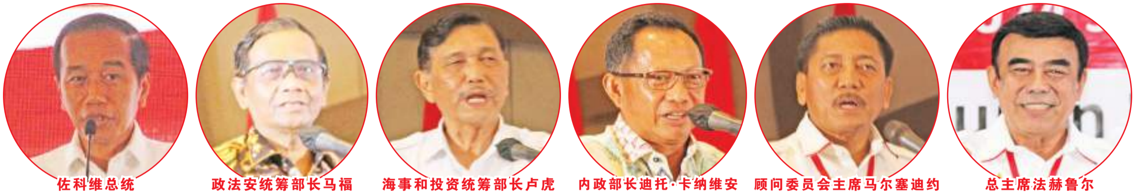
佐科维总统 政法安统筹部长马福 海事和投资统筹部长卢虎 内政部长迪托·卡纳维安 顾问委员会主席马尔塞迪约 总主席法赫鲁尔