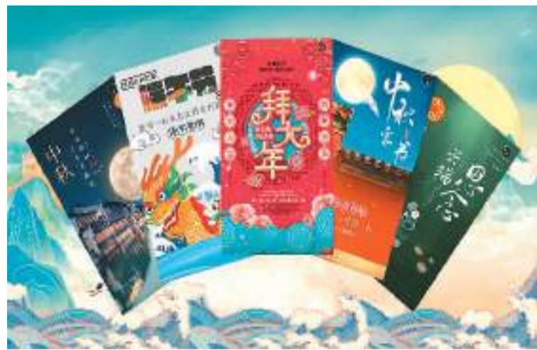
图为江苏省侨联寄给海外侨胞的节日“电子家书”。

“叮咚!这里有一封家书请您查收!”每逢中国传统佳节,海外江苏籍侨胞总能收到寄自侨联的H5电子“家书”。悠扬的音乐搭配精美的H5动画,给海外侨胞带来家乡的温暖和问候。近年来,江苏省侨联积极探索远程为侨服务新模式,让海外华侨华人享受到“天涯若比邻”的贴心关怀和服务。