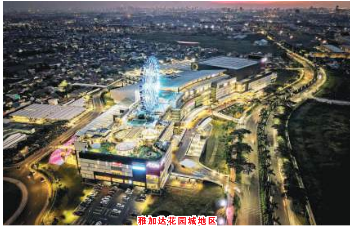
雅加达花园城地区

Rich Carlton Hotel Pacific Place 宴会厅举行。该奖项自 2003 年开始举办，旨在表彰建造和设计体积最大的物业、创造绿色环保建筑设计和令人印象深刻的室内设计的开发商公司。在亚洲七个地区举行，即香港、印度尼西亚、马来西亚、菲律宾、新加坡、泰国和越南。