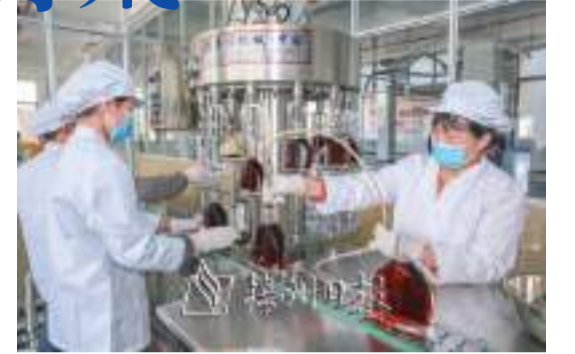
隨着梅州綜合保稅區順利封關運行，區內企業博捷酒業(廣東)有限公司首批從法國進口的白蘭地酒液進行試產。

接下來，梅州綜保區將按照市委、市政府的工作部署，全力發揮國家級平臺作用，在外資外貿方面深挖存量、做大增量，大力開展招商引資工作，努力將梅州綜保區打造成梅州外貿經濟發展的新增長極和對外開放新高地。(本報記者 黃科)