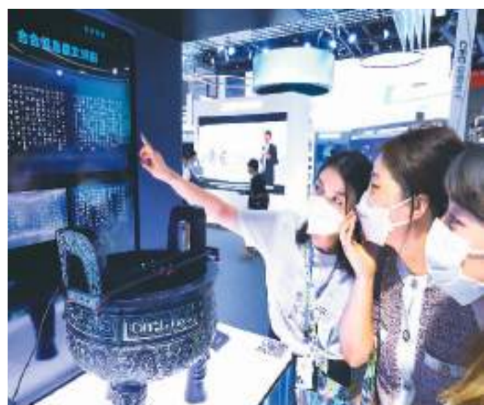
9月1日，2022世界人工智能大会在上海世博中心拉开帷幕。今年大会的主题是“智联世界 元生无界”。图为工作人员（左一）向参观者介绍一款智能文字识别AI系统对青铜器铭文的识别展示。

中国电子商务大会作为2022年中国国际服务贸易交易会高峰论坛之一，由商务部、北京市人民政府主办。