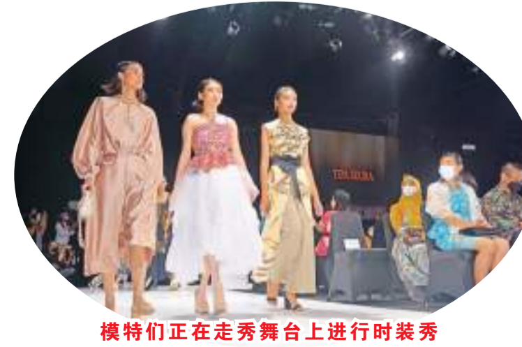
模特们正在走秀舞台上进行时装秀