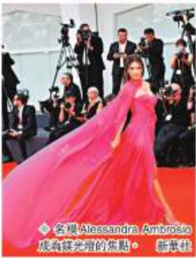
◆名模Alessandra Ambrosio成為發光體的焦點。新華社