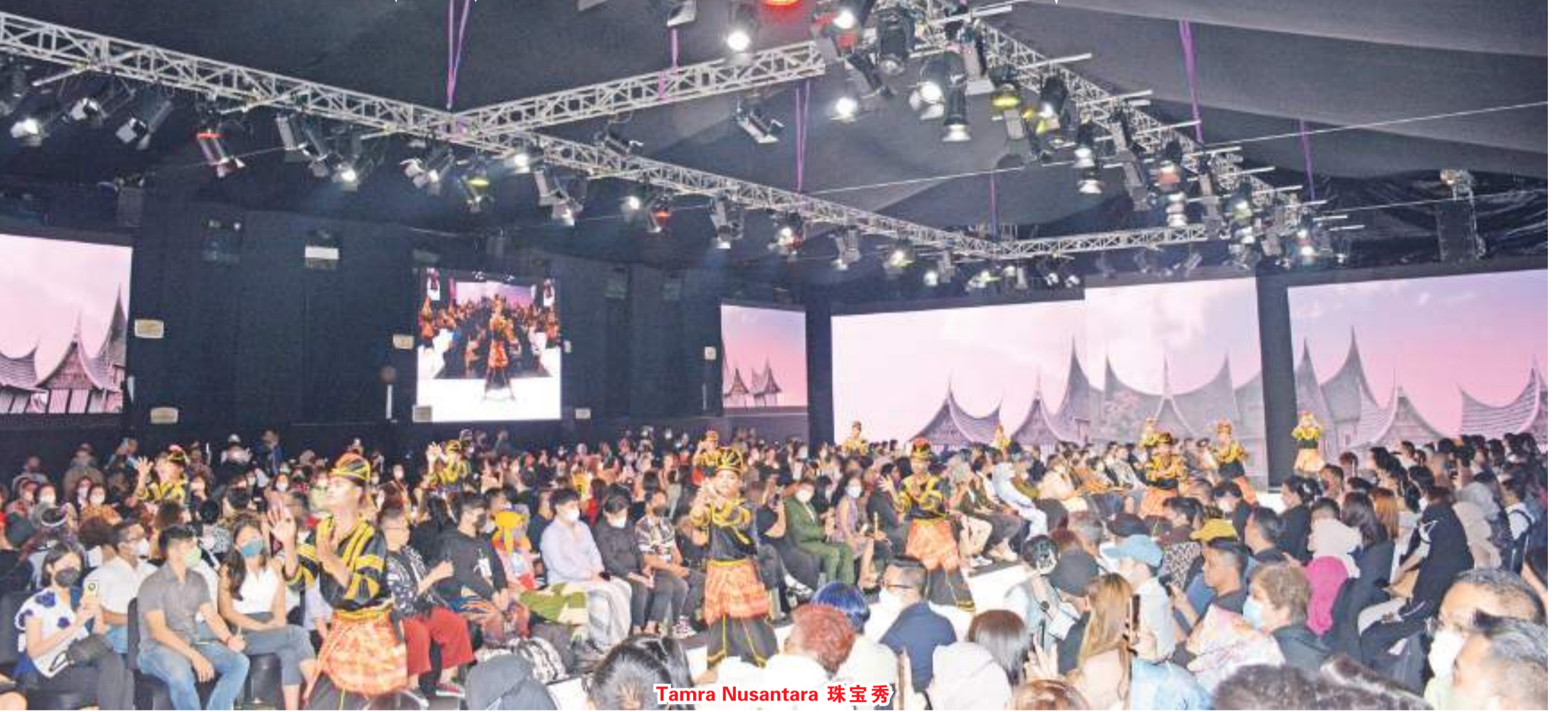
Tamra Nusantara 珠宝秀