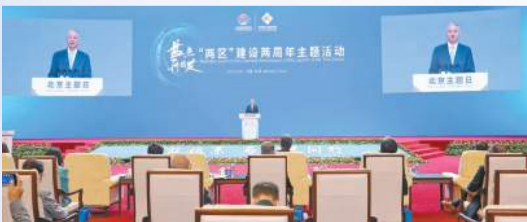
服貿會「北京主題日」「兩區」建設兩周年主題活動現場。

金秋九月，丹桂飄香。正值中國國際服務貿易交易會火熱之時，北京「兩區」建設在收穫的季節迎來了兩周年。「兩區」建設兩周年主題活動於「北京日」首日盛大開幕，全面盤點「兩區」建設成效，展示開放機遇下的北京新貌。