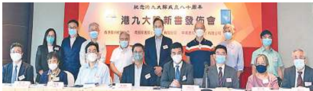
《港九大隊志》及《港九獨立大隊史》新書發布會昨日舉行。

【香港商報訊】記者馮煒強報道：今年是東江縱隊港九獨立大隊(港九大隊)成立80周年，港九大隊是中國共產黨領導的抗日游擊隊，是香港淪陷期間唯一一支成建制、由始至終堅持抵抗的抗日武裝力量。為了讓香港市民和內地群眾更深入認識港九大隊的歷史貢獻，在香港廣州社團總會支持之下，香港商務印書館和香港中華書局推出《港九大隊志》及《港九獨立大隊史》繁體字版兩本新書，新書發布會於昨日隆重舉行。