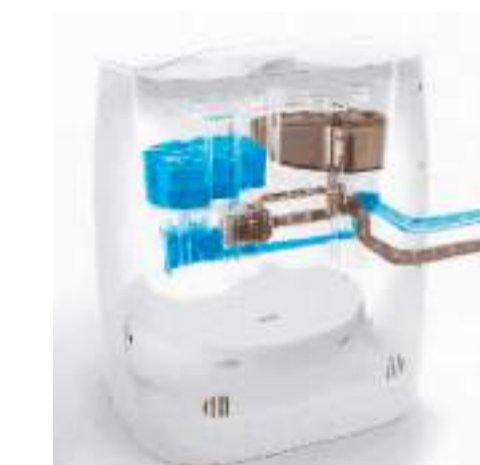
▲ 扫地机器人自动上下水装置示意图。 ▲ 云鲸智能研发团队就扫地机器人的拖地功能进行讨论。 ▲ 测评博主王渔斌正在拆解对比多款扫地机器人。