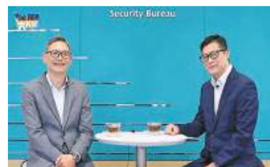
鄧炳強(右)在節目中訪問保安局副局長卓孝業。

卓孝業又透露，在擔任警察前，曾做酒樓部長，稱自己最喜愛的食品是牛腩麵。他又笑言，希望鄧炳強能請他吃牛腩麵和飲奶茶。