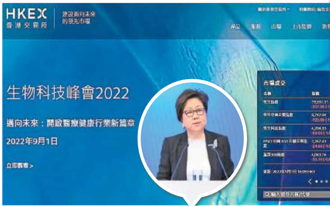
史美倫認為，上市制度改革後，香港已成為支持新經濟及生物科技公司融資的領導者。 資料圖片

【香港商報訊】記者鄭偉軒報道：港交所(388)主席史美倫昨日出席「港交所生物科技峰會2022」時表示，香港作為國際金融中心和超級聯繫人，在全球生物科技和醫療健康的發展中扮演了重要角色，未來將致力連接內地醫療健康行業的人才與全球資本。港交所行政總裁歐冠昇在同一場合則指，將會繼續支持生物科技交易所買賣基金(ETF)的開發，豐富醫療健康產品生態圈。