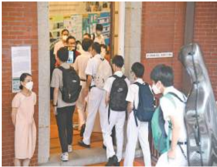
西營盤英皇書院一批學生於開學日排隊量度體溫。

【香港商報訊】記者戴合聲報道：9月1日是全港開學日，因應新冠疫情升溫，昨早不少家長在送小朋友上學時，均小心翼翼為他們做好防疫措施，包括戴好口罩及用酒精搓手液消毒。學校亦做足各種防疫措施，以防萬一。運輸署表示，昨早交通大致暢順，公共運輸服務基本上能滿足需求，署方將繼續密切監察交通及公共運輸服務情況。