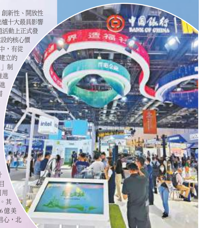
中國銀行攜數字化金融服務全新亮相2022年服貿會。

項目成果耀眼。58個項目集體簽約，紛紛落地全市各區和經開區，涉及航空、汽車、通信等多個重點產業，累計簽約額1024億元。兩年來，「兩區」建設重大項目庫累計入庫項目6784個，已落地出庫項目3291個。今年1-7月，全市實際利用外資135.8億美元，同比增長29.9%。其中，自貿試驗區實際利用外資43.6億美元，顯示了跨國公司對北京的投資信心，北京對外資的吸引力持續增強。