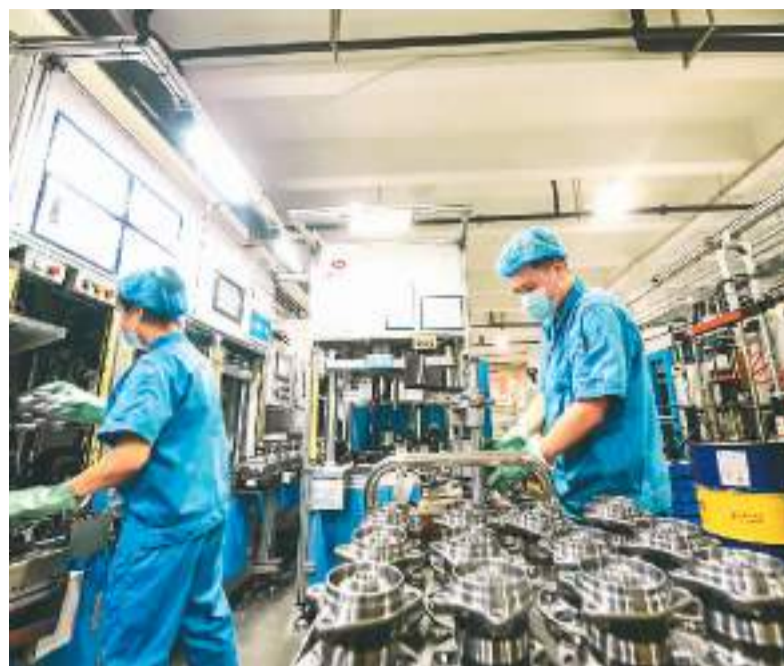
近来，随着工业用电逐渐恢复，重庆工业企业全面复工复产，各企业开足马力赶制订单产品，满足市场需求。图为重庆市经开区长江轴承厂工人正在车间工作。