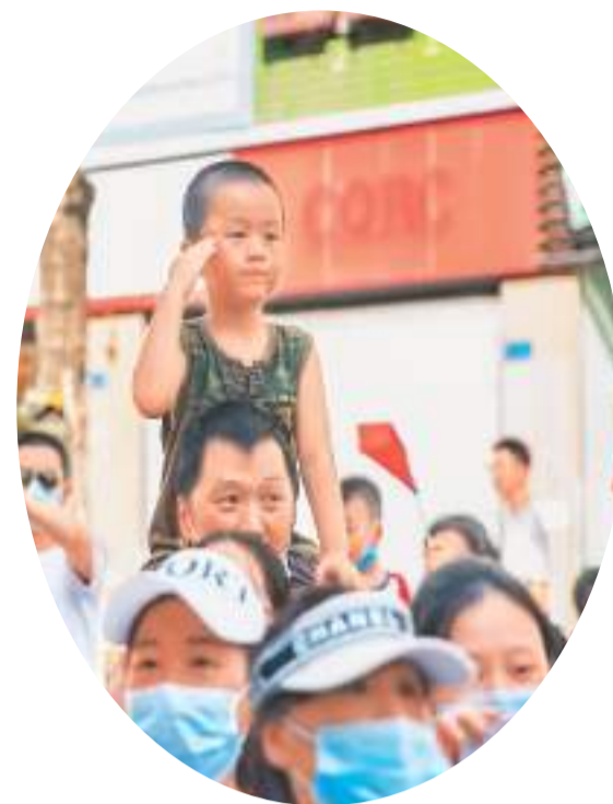
▲8月28日，在重庆市北碚区，一名小男孩向撤离的森林消防车队敬礼。