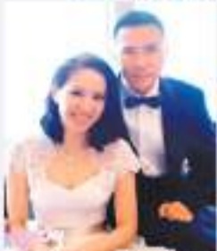
◆甄子丹與汪詩詩結婚19年。

香港文匯報訊(記者 阿祖)甄子丹向來出名「愛妻奴」,跟太太在詩詩一直形影不離,而8月30日是二人結婚19周年紀念日,子丹卻因身在內地工作,未能陪伴在多倫多的太太,但他仍越洋送大束玫瑰花,給詩詩浪漫的驚喜。子丹更於社交平台貼上短片,全部是二人過往一起共度歡樂時光的合照和片段製作而成,記錄了二人19年來的愛情。子丹還發表愛的宣言:「甄太,19th結婚周年快樂哦!雖然今年我又再片場度酒,但每時每刻你都在心裏的!」汪詩詩亦貼出10張夫妻甜照合照寓意十全十美,並表示對子丹甚為掛念。