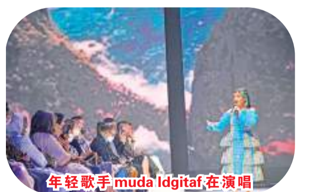
年轻歌手 muda Idgitaf 在演唱