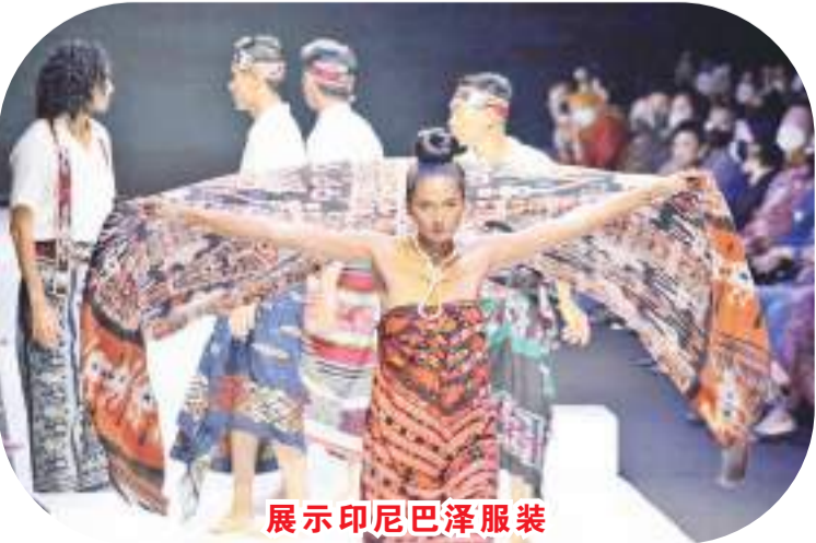
展示印尼巴泽服装