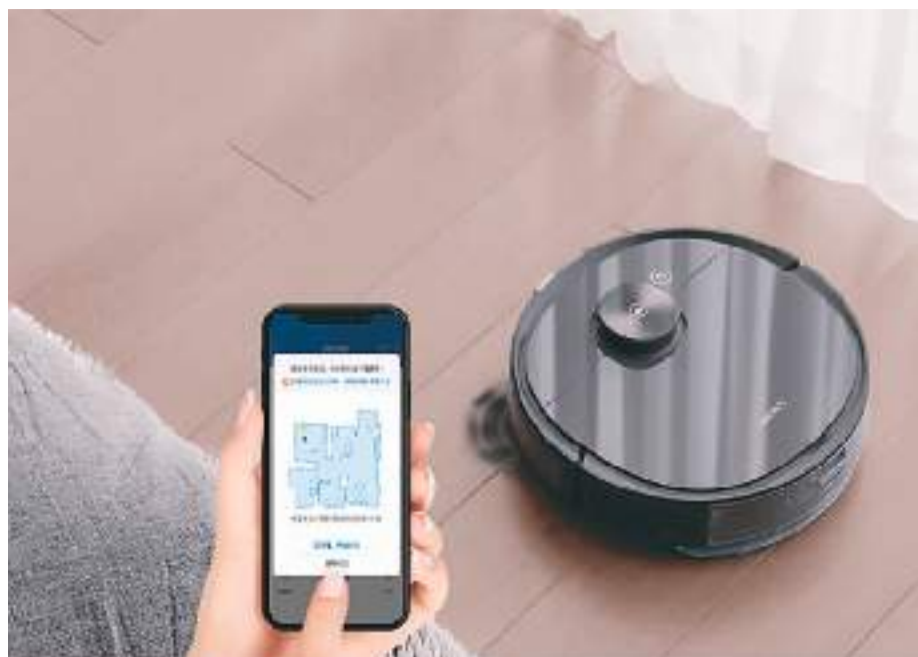
扫地机器人正在作业。