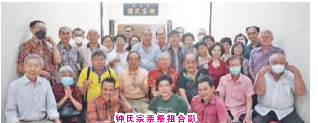
钟氏宗亲祭祖合影