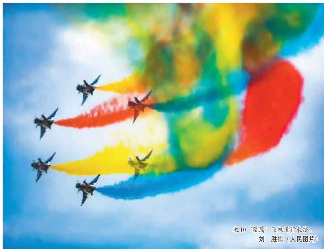
教10“猎鹰”飞机进行表演。