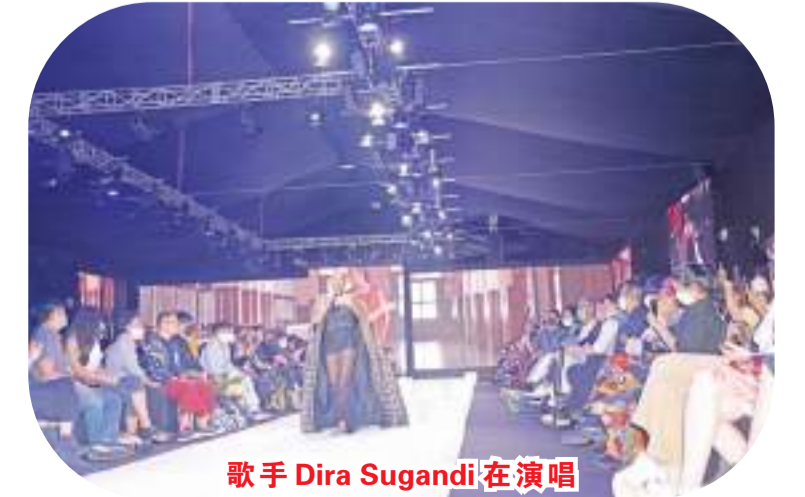
歌手 Dira Sugandi 在演唱