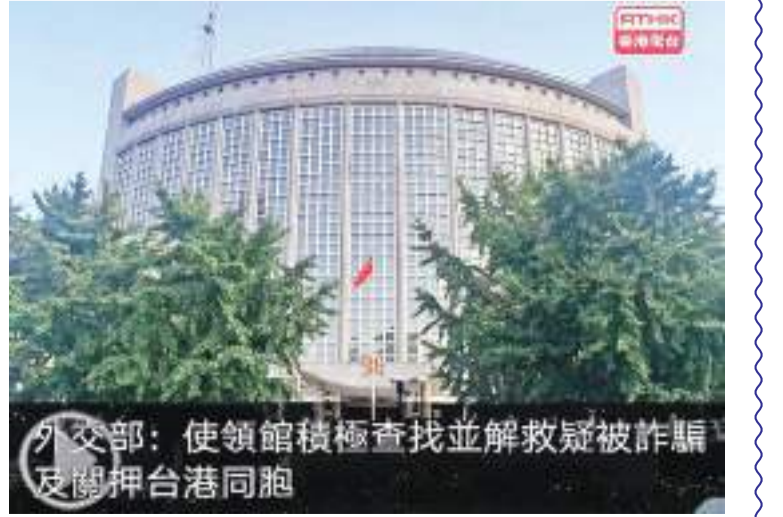
外交部: 使領館積極查找並解救疑被詐騙及關押台港同胞

利用中华公所在美国华人中崇高的地位与声望, 去做为达到他们分裂中国之目的事情。中华公所前任主席于金山, 就曾受以“唱衰中国”为生的过气民运人士王丹之托, 协助其向台湾当局讨取经费, 并利用中华公所的声望去向当局申请地方, 筹建“六四大屠杀纪念馆”。这属典型的利用中