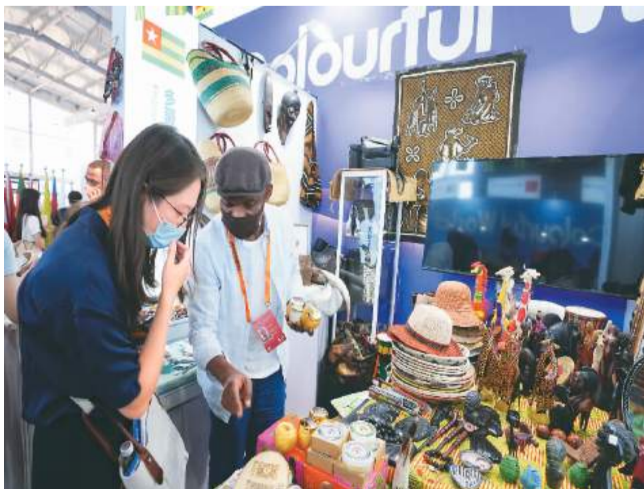
9月1日，第七届“炫彩世界”——“一带一路”沿线国家特色文化展示活动在2022年中国国际服务贸易交易会上举行。图为首钢园区，参观者（左）在了解展出的多哥共和国展品。