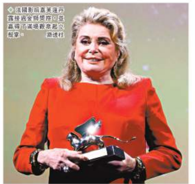
◆法國影后嘉芙蓮丹露接過金獅獎座,並贏得滿場觀眾起立鼓掌。