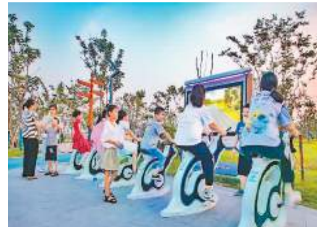
近日,在江苏宿迁宿豫区天柱山路公园内,市民体验电子竞速脚踏车,感受健身快乐。

“戏”解困乏。中医五禽戏通过肢体锻炼,促进气血通畅、保养脏腑。“鸟戏”主肺,应和秋季。人体直立时模拟鸟儿水平展开双臂,上举过头、下落平肩,配合单膝90度交替上抬(建议“四八”拍节奏),可补肺气、宽胸膈,增强血氧交换。 (作者为北京协和医院中医科副主任医师)