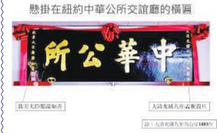
懸掛在紐約中華公所交誼廳的橫匾

在已有愈百年历史的“美国纽约中华公所”档案内, 有一个名为 Lok Yip Gwai Gun 的部份。这档案名字从粤语翻译成国语就是: 落叶归根。