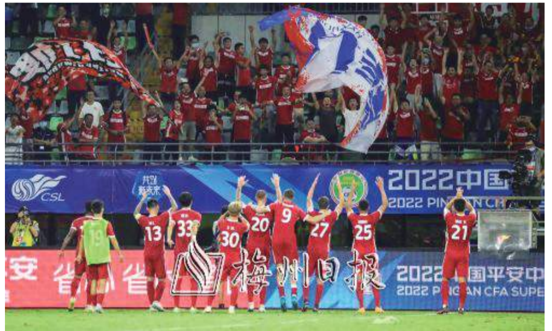
梅州客家今年首次徵戰中超聯賽，登上中國頂級職業聯賽的大舞臺。

“足球之鄉”梅州歷史文化底蘊深厚，是中國內地現代足球發源地，有140多年歷史。黨的十八大以來，梅州遵循足球運動發展規律，多措並舉推動足球改革發展，建設梅州足球特區，全力創建全國足球發展重點城市，逐漸走出了一條具有梅州特色的足球改革發展新路子，球鄉梅州在新時代煥發出新光彩。