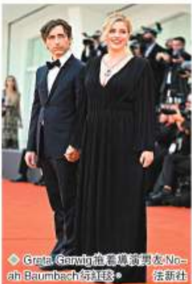
◆Greta Gerwig與導演男友Noah Baumbach同場亮相。

擔任威尼斯影展評審團主席的美國女星茱莉安摩亞,一襲低胸透視洋裝披上閃耀斗篷現身,優雅性感,馬上搶走紅毯焦點;巴西名模Alessandra Ambrosio則以粉紅色低胸禮服示人,色彩奪目又性感,非常搶鏡。 本屆共有23部影片入圍主競賽單元,角逐最佳影片金獅獎。外觀點名,值得期待的獲獎大片,有Netflix出品的《White Noise》和《Blonde》,有望角逐最高榮譽金獅獎。威尼斯影展不同於其他影展紅毯,對串流平台製作的電影一視同仁,由Netflix出品的《White Noise》更成為今年的開幕片,屬於史上第一次。美國導演Noah Baumbach和男、女主角Adam Driver、Greta Gerwig與美國男星Don Cheadle等演員因而在紅毯上備受矚目,而Greta與導演男友Noah攜手行紅地毯,曾演出《星戰7》的Adam大受歡迎,他親民地為現場粉絲簽名與合照。 至於《Blonde》由澳洲導演Andrew Dominik執導,他稱這部作品是「傑作」,可以讓古巴女演員Ana de Armas從影壇後起之秀,一舉躍升至一線明星之列。