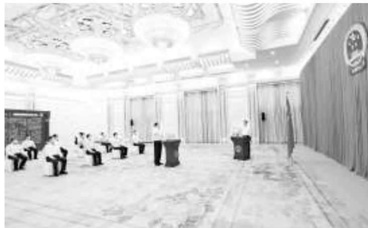
9月2日,十三届全国人大常委会在北京人民大会堂举行宪法宣誓仪式。全国人大常委会副秘书长郝明金主持并监督。

新华社北京9月2日电 十三届全国人大常委会2日上午在北京人民大会堂举行宪法宣誓仪式。全国人大常委会副秘书长郝明金主持并监督。刚刚闭幕的十三届全国人大常委会第三十六