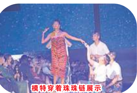
模特穿着珠珠链展示