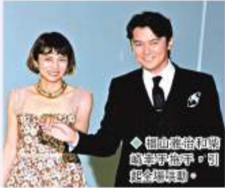
◆福山雅治和柴崎幸手拖手,引起全場騷動。