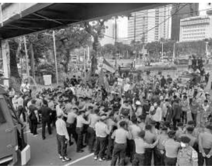
一群雅加达努山达拉大学学生举行示威游行

学们继续向前进,没有后退的说法,确保我们总是向前走,与这个国家的不公正作斗争。同学们继续前进,拆除封锁。 一些大学生冲向前,他们踩倒了铁丝网封锁线,并在铁丝网上焚烧横幅。 两层铁丝网被破坏,执法人员随后在受损的铁丝网前竖起了路障。在执法人员后面几米处,还安装了障碍物。 (亮剑)