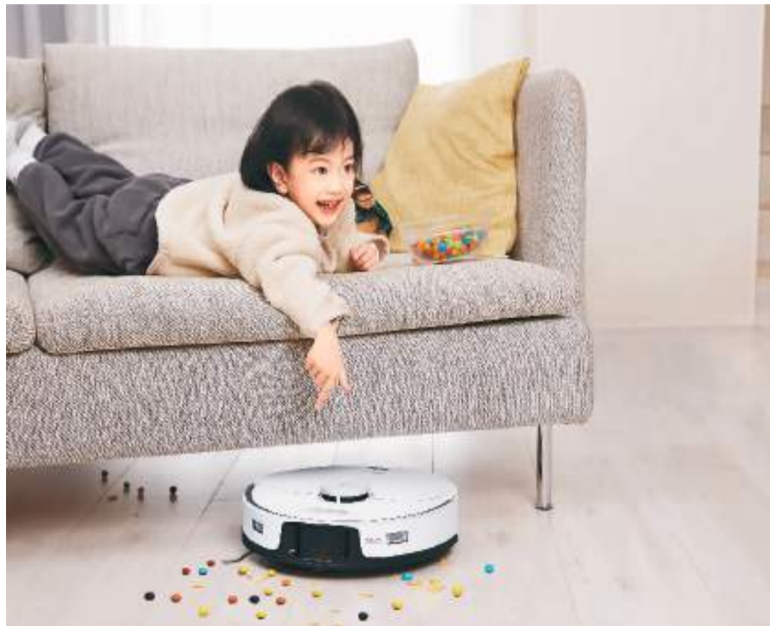
扫地机器人正在吸附糖豆、饼干碎屑。

如果说之前，各大品牌瞄准的是完善清洁、导航避障、自清洁功能，那么如今，大家比拼的就是谁的产品功能更丰富、更细化。星图金融研究院高级研究员付一夫指出，得益于人工智能、物联网、云计算等日渐成