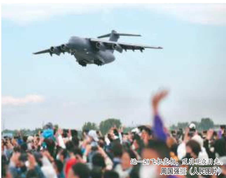
运—20飞机亮相，吸引观众目光。

8月26日，空军航空开放活动暨长春航空展在吉林长春开幕。歼—20、运—20展翅长春，新一代空中加油机运油—20首次向社会公众展示；中国空军“八一”飞行表演队和空军航空大学“红鹰”“天之翼”飞行表演队共舞蓝天；歼—16、轰—6K、空警—500等新型装备成体系集中展示。这次航空开放活动，集中展现空军“奋斗强军、奋飞十年”的建设发展成就。