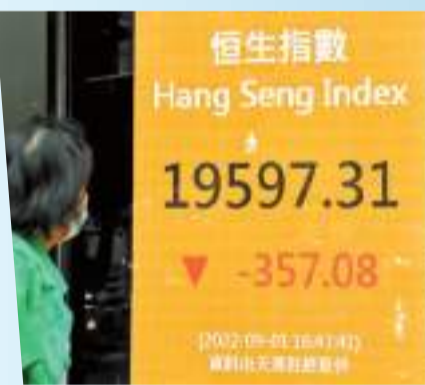
恒指於9月首個交易日挫357點。

內地一些城市接連爆發新冠肺炎疫情，需要實施疫情管控措施，拖累部分內需及旅遊股份下跌。其中海底撈(6862)跌4.84%，收報17.7元；復星旅遊文化(1992)跌2.54%，收報10.76元。