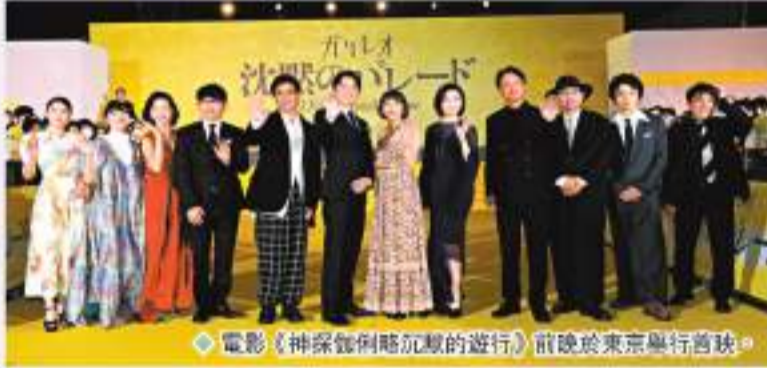
◆電影《神探伽俐略沉默的遊行》前晚於東京舉行首映。

香港文匯報訊 日本推理小說之神「東野圭吾」的伽俐略系列最新作——《神探伽俐略沉默的遊行》,將於9月22日在香港緊貼日本上映。電影前晚於東京舉行大型首映,導演西谷弘帶同全員現身造勢,包括系列原班人馬——福山雅治、柴崎幸、北村一輝,還有重磅加盟的飯尾和樹、戶田菜穗、田口浩正、酒向芳、岡山天音、川床明日香、出口夏希、村上淳、吉田羊、檀麗、椎名桔平等,場面盛大。 為隆重其事,電影公司將紅地毯化身成綠草如茵的海報主題顏色,更包下大型房車接載演員到場,盡顯大片氣勢。