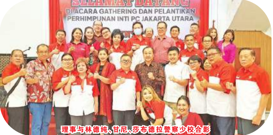
理事与林德纯、甘尼、莎布德拉警察少校合影