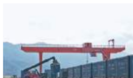
◆中老鐵路開通9個月，累計運輸貨物717萬噸。

目前，中老鐵路貨運量從開通初期單月24萬噸，增長至8月份單月117萬噸，貨運量穩步提升。隨着鐵路部門對「瀾滄快線」+跨境電商、「中老鐵路+中歐班列」等鐵路國際運輸新模式不斷探索，還將進一步增強中老鐵路輻射效應和跨境貨運能力，讓更多企業享受中老鐵路帶來的機遇和利好，最大程度發揮好中老鐵路的經濟紐帶作用。