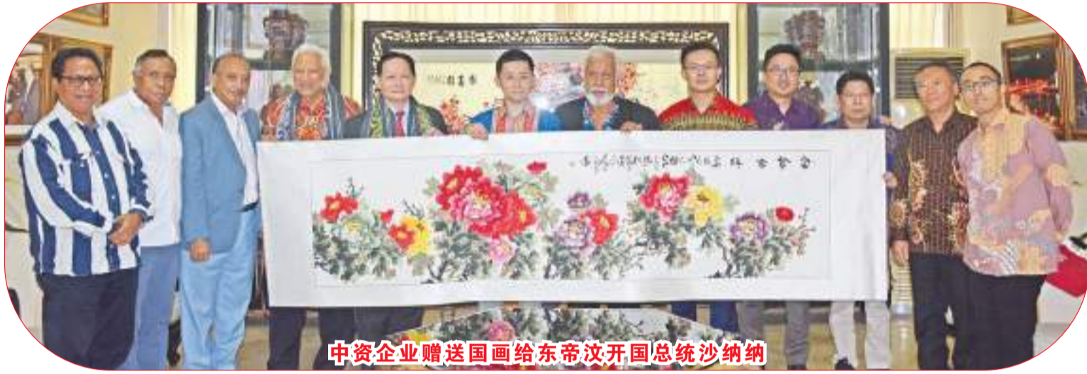
中资企业赠送国画给东帝汶开国总统沙纳纳