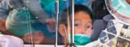
◆嫦娥五號月壤是44年以來人類再一次獲得來自月球的返回樣品。圖為觀眾觀看展出的月壤。

研究團隊首先在部分鐵橄欖石顆粒表面非晶層中發現了原位熱分解成因的單質金屬鐵，為嫦娥五號月壤中存在新的成因機制的納米金屬鐵提供了直接證據，相關研究結果已於2022年2月發表於《地球物理研究通訊》（Geophysical Research Letters）期刊上。隨着工作的持續深入，研究團隊在一顆鐵橄欖石顆粒的表面發現分布有亞微米級尺度的微型撞擊坑，同時表面熔融噴射物較少，保存了較好的撞擊改造的特徵。