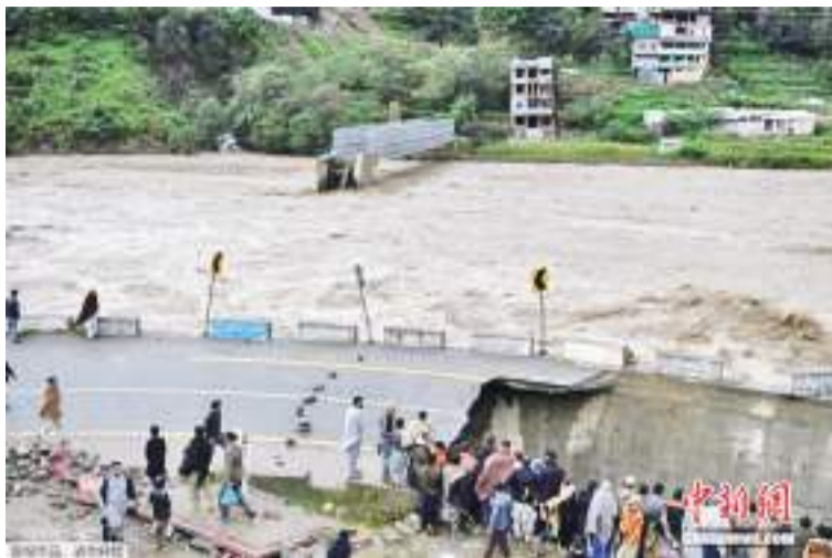
资料图：据巴基斯坦《黎明报》8月26日报道，巴基斯坦最近一段时间以来，强降雨引发洪水等灾害已致3000万人无家可归。巴政府官员称进入“国家紧急状态”。

9月3日，国家国际发展合作署署长罗照辉视频会见巴基斯坦灾害管理局主席阿克塔。罗照辉说，巴方遭受数十年未遇的洪灾，造成重大人员伤亡和财