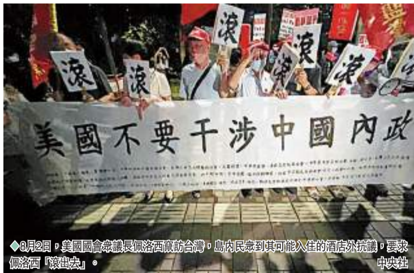
◆8月2日，美國國會眾議院議長佩洛西西訪台灣，島內民眾到其可能入住的酒店外抗議，要求佩洛西「滾出去」。