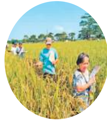
▲ 当地农户积极参加“高产栽培技术示范农田间”活动。