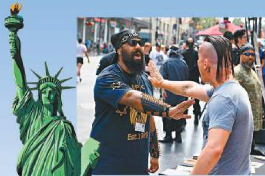
◆美國社會撕裂加劇，兩派人士屢發生衝突。 資料圖片