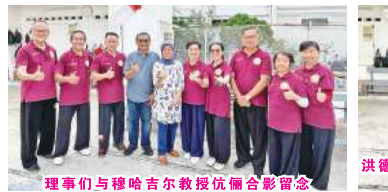
理事们与穆哈吉尔教授伉俪合影留念