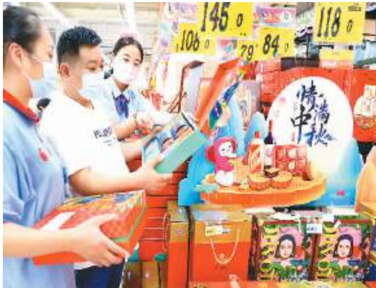
中秋节临近，安徽省淮北市各大商场超市传统食品购销两旺，节日气氛浓厚。图为在淮北市淮海路大润发大型超市内，市民在“中秋大街”卖场选购月饼。

旅游消费更新潮多样。中秋集市、汉服游园、花灯船宴……中秋小长假期间，国内多个目的地及景区将推出多种体验类活动，为游客的文