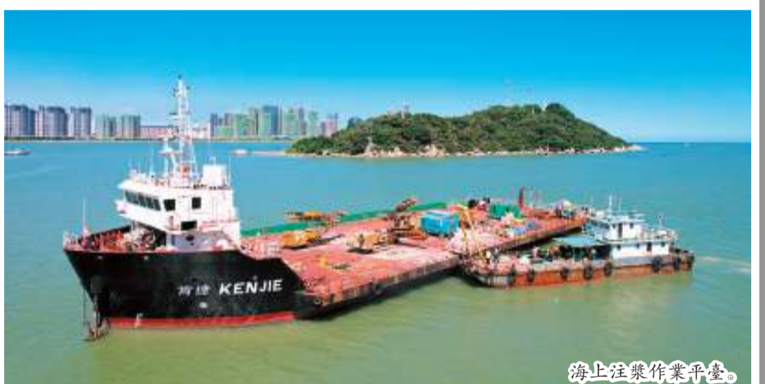
海上注漿作業平臺

【汕頭日報訊】8月15日，隨著海上垂直注漿作業船、設備及人員到位，由中鐵十四局承建的汕汕鐵路汕頭灣海底隧道正式開啓海上注漿作業，為隧道穿海之旅“夯實道路”。