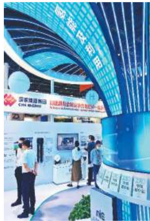
二〇二二年中国国际服务贸易交易会期间，举办了综合展和专题展。其中，文旅服务、教育服务等八个专题仍在首钢园区，环境服务专题设在国家会议中心二期，共同展示各类新技术、新成果、新业态、新模式。图为九月二日，观众在环境服务专题展区参观。

通知明确，上述调整的执行期限为2022年9月至2023年3月，对应2022年8月至2023年2月物价指数。