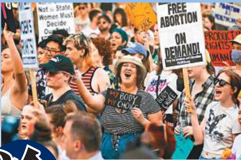
◆美國的政策正在分裂，特別在有關墮胎權等重要議題上。 資料圖片