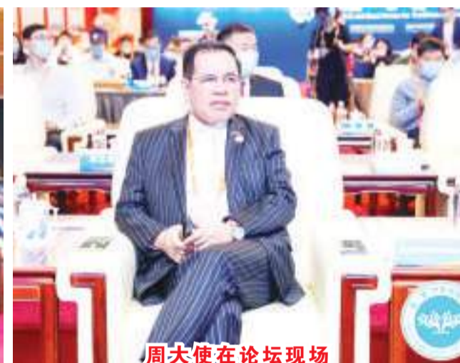
周大使在论坛现场