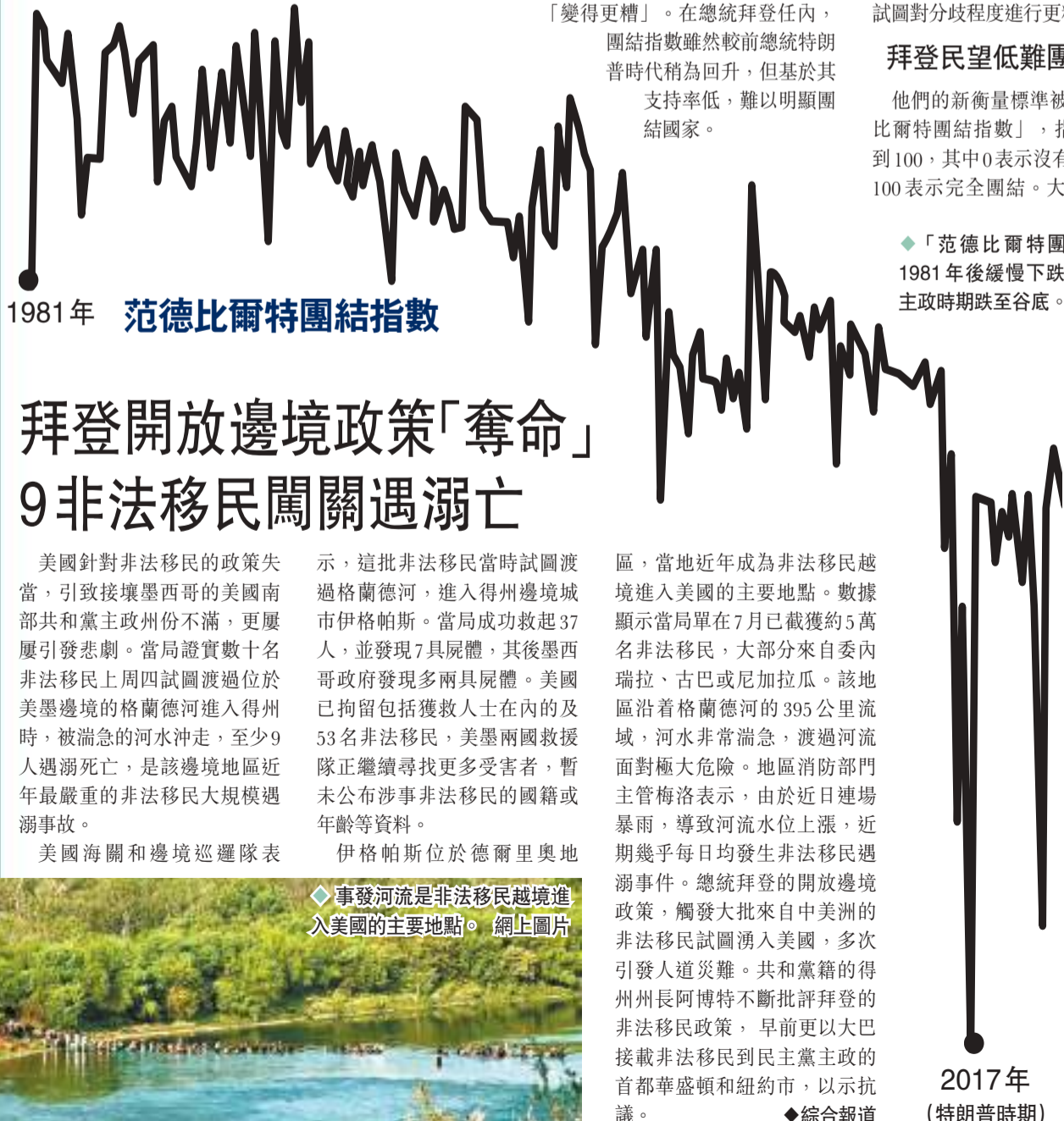
1981年 范德比爾特團結指數

拜登競逐大選時，承諾要讓美國團結起來，他通過一些受關注的兩黨立法，包括總值1萬億美元的基礎設施法案，極端分化程度在其任內確有所下降，但因他的民意支持度偏低，故此團結指數始終維持低位。 ◆綜合報道