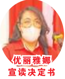
优雅雅娜宣读决定书