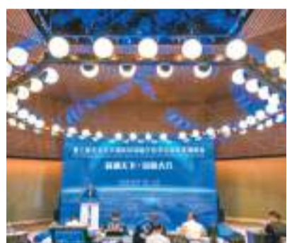
◆第三屆北京大興國際機場臨空經濟區協同發展峰會上現場。

同時，此次理論計算的結果表明該二次撞擊坑的形成速度低於3.0km/s，由於低速撞擊作用廣泛存在於太陽系之中，因此這對於研究月球特別是兩極永久陰影區、小行星以及外太陽系固態天體表層中單質金屬鐵的形成機制具有廣泛的參考與借鑒意義。