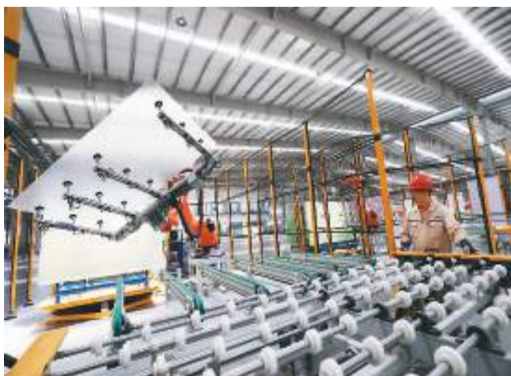
近年来，湖南省资兴市依托大储量、高品位的硅石资源优势，大力发展硅产业链上下游项目，推动县域经济快速发展。图为资兴市经济开发区资五产业园郴州旗滨光伏光电玻璃有限公司二期光伏组件高透盖板材料生产车间。

科技创新能力明显增强。通过推动实施工业强基工程、出台国家新材料重点平台及首批次保险等政策，原材料工业研发投入强度由2012年的0.62%提高到2021年的1%左右，科技论文和发明专利数量全球第一，300余项材料技术获得国家科学技术奖。关键材料不断突破，超导材料领域具备全球唯一的全流程生产能力，有序