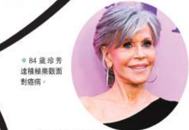
◆84歲珍芳達積極樂觀面對病痛。