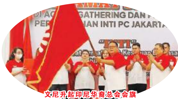
文尼升起印尼华裔总会会旗