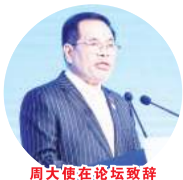
周大使在论坛致辞

【本报讯】9月2日，印尼驻华大使周浩黎(Djauhari Oratmangun)在驻华大使馆经济处代表等陪同下参加了在北京国家会议中心举行的第五届“一带一路”中医药发展论坛。本届论坛由中国国际贸易促