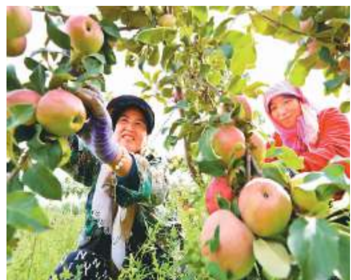
目前，位于祁连山下的甘肃省张掖市民乐县工业园区戈壁农业现代化密植苹果示范基地，300多亩现代化密植苹果进入成熟采摘期。果农们忙碌着采摘、挑选、搬运和冷藏丰收的果实，果园内到处是一派忙碌喜悦的景象。图为果农采摘现代化密植苹果。

(CDD)指数。其中，以北京为代表的华北地区为玉米、小麦重要产区，以哈尔滨为代表的东北地区是大豆和玉米主要产区。相关温度指数可以较为有效地表征大豆和玉米等作物生长气温情况。今后，宏观管理部门可以参考该指数，为农产品保供稳价制定更加精准的政策；农业生产者可以根据该指数评估收获季的产量和价格，从而提前制定生产经营计划和风险管理计划。