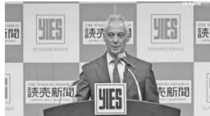
当地时间周五(9月2日)，美国驻日本大使拉姆·伊曼纽尔在东京“读卖国际经济恳谈会”上发表演讲 视频截图

美国驻日本大使发表狂妄言论。据日本《读卖新闻》英文版4日报道，美国驻日本大使拉姆·伊曼纽尔当地时间周五(2日)在东京“读卖国际经济恳谈会”上发表演讲，鼓吹美日同盟从“盟友保护(Protection)时代”进入所谓“向印太地区同盟投射(Projection)的时代”。他还指责中国在台海等问题上“违反规则”。对于此动就拿周边邻国说事，无一次明确警告美日频繁发布类似涉华消息的举动：拉帮结伙搞“小圈子”，煽动集团对抗，只会让世人越来越看清“美日同盟”危害地区和平稳定的本质和图谋。