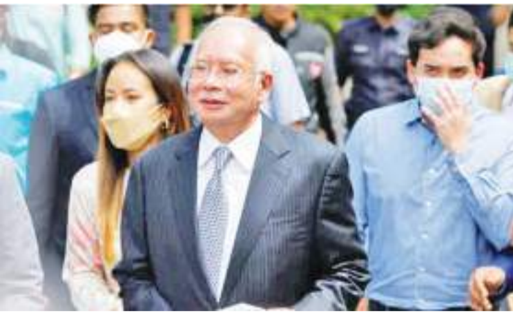
马来西亚前总理纳吉布

据当地媒体9月4日报道，在马来西亚雪兰莪州加影监狱服刑的马来西亚前总理纳吉布今日被送往雪兰莪州加影监狱治疗。