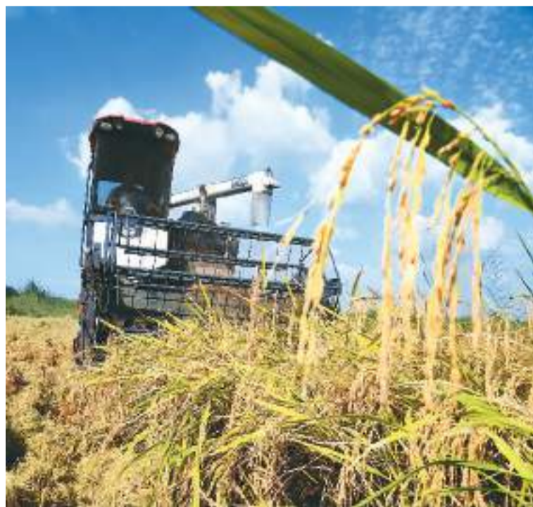
初秋时节,安徽省肥东县水稻渐次成熟,农民抢抓晴好天气收割,确保颗粒归仓。图为9月2日,肥东县店埠镇花滩社区合肥禾丰农机服务合作社农民驾驶收割机抢收中稻。方好摄(人民视觉)

中国生态环保产业服务专区首次亮相服贸会 万亿产业助力美丽中国建设 本报北京9月2日电(记者刘发为)8月31日,2022年中国国际服务贸易交易会在京开幕。记者从中国环境保护产业协会获悉,本届服贸会新设环境保护产业专区,其中的“中国生态环保产业服务专区”也是首次亮相服贸会。中国生态环保产业服务专区以中国生态环保产业十年成就为主线,展现中国生态环保产业在污染防治攻坚战和生态文明建设中所作出的贡献。 党的十八大以来,中国生态环保产业迎来了新的发展机遇。2021年中国生态环保产业营业收入约2.18万亿元,比2020年增长11.8%,对国民经济直接贡献率为1.8%。当前,中国生态环保产业体系和布局更加优化,形成了涵盖污染治理和生态修复技术研发、装备制造、设计施工、运行维护、投资运营、综合咨询等全产业链的生态环保产业体系。中国生态环保产业在协同推进生态环境保护水平保护和高质量发展中发挥了重要作用,有力促进发展方式和生活方式绿色转型,为建设美丽中国增添了绿色动力。