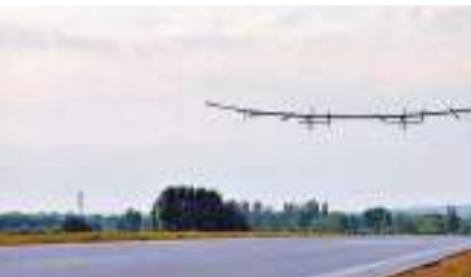
◆由航空工業一飛院研製的「啟明星50」大型太陽能無人機在陝西榆林順利完成首飛任務。

香港文匯報訊 據央視新聞客戶端報道，9月3日，由中國航空工業一飛院研製的「啟明星50」大型太陽能無人機在陝西榆林首飛成功。