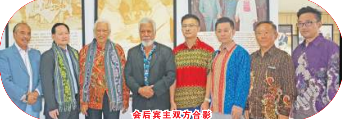
会后宾主双方合影