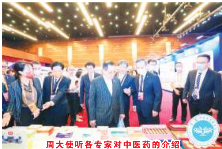
周大使听各专家对中医药的介绍

出席此论坛的还有利比亚副总统、孟加拉国卫生部长、津巴布韦和阿联酋驻华大使及各医药领域专家、学术研究者及各企业家等；此外，联合国前秘书长潘基文还专门向论坛组织方发来贺信。(供稿：印尼驻华大使馆)