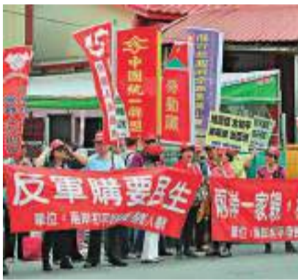
◆台灣民眾上街集會，表達「反軍購要民生」訴求。資料圖片

數據顯示，自1979年美與台當局「斷交」至今，美售台武器的規模和性能不斷提升，43年對台軍售總額超過700億美元。其中，特朗普政府執政4年累計對台軍售11次，金額達200億美元。拜登政府上任以來已6次批准對台軍售，涉及愛國者導彈系統、自行火炮、彈藥補給車等先進裝備和系統。