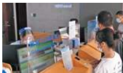
◆鐵路部門推出多項新服務，中老鐵路黃金大通道作用日益顯現。