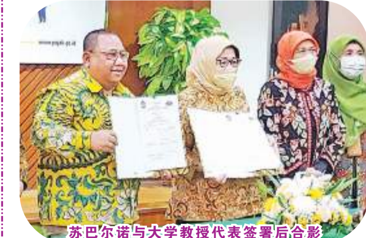
苏巴尔诺与大学教授代表签署后合影

【本报讯】2022年10月4日，雅加达西区税务总局区域办事处负责人与Trisakti大学1副校长与4间Trisakti代表，在Trisakti大学A校园区商学院大堂签署续约设立大学税务中心合作备忘录。 自2011年税务总局