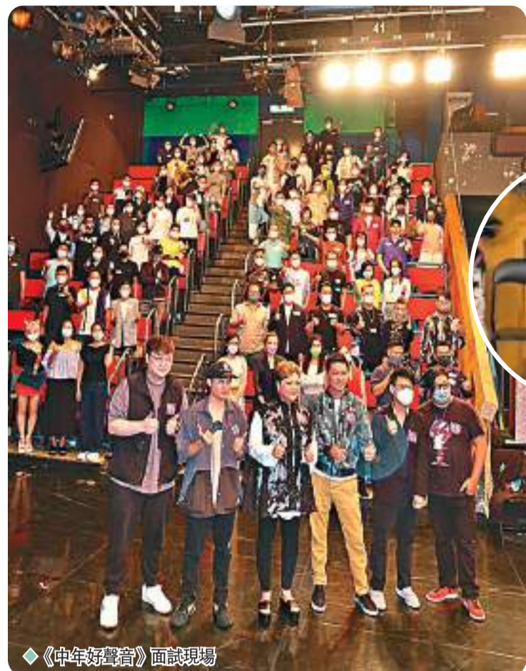
《中年好声音》面試現場