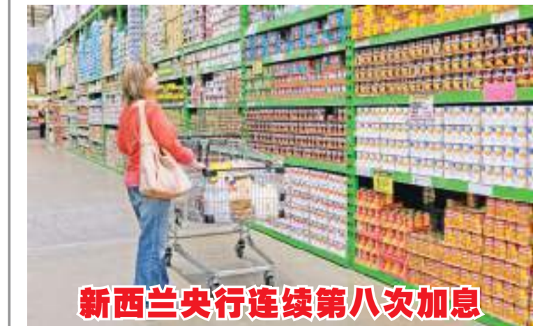
新西兰央行连续第八次加息 10月5日，一名顾客在新西兰奥克兰的一家超市选购商品。新西兰央行5日宣布，再次将基准利率上调50个基点至3.5%。这是该行自2021年10月以来连续第八次加息。

吕特在记者会上表示，荷兰和德国过去一年的能源合作尤为密切，未来双方将继续就能源转型和能源安全等深入合作。乌克兰危机爆发以来，受欧盟对俄罗斯制裁产生反噬效应影响，欧洲能源供应紧张，天然气和电力价格飙升，导致整体通胀水平居高不下，令欧洲经济承压。