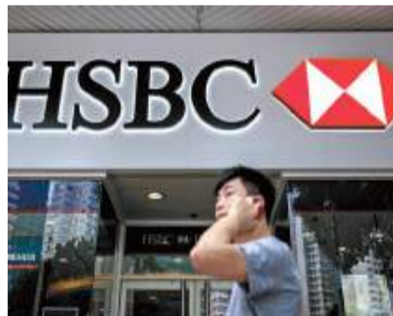
滙控業務眾多，沽售部份生意不足為奇。