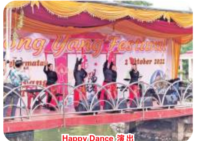
Happy Dance 演出