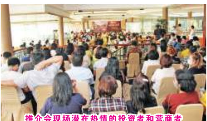
推介會現場潛在熱情的投資者和營商者