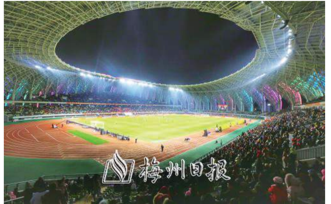
梅州足球場地1027塊，每萬人均2.6塊居全省第一、全國領先。圖為五華奧林匹克體育中心。