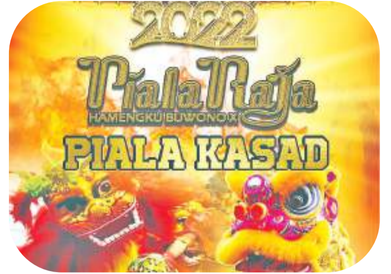
龙狮比赛宣传海报