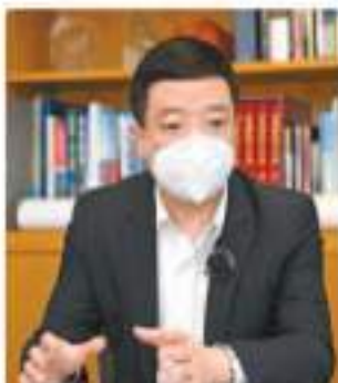
方舟認為，特區政府可考慮在更多口岸採取「合作查驗、一次放行」方式。