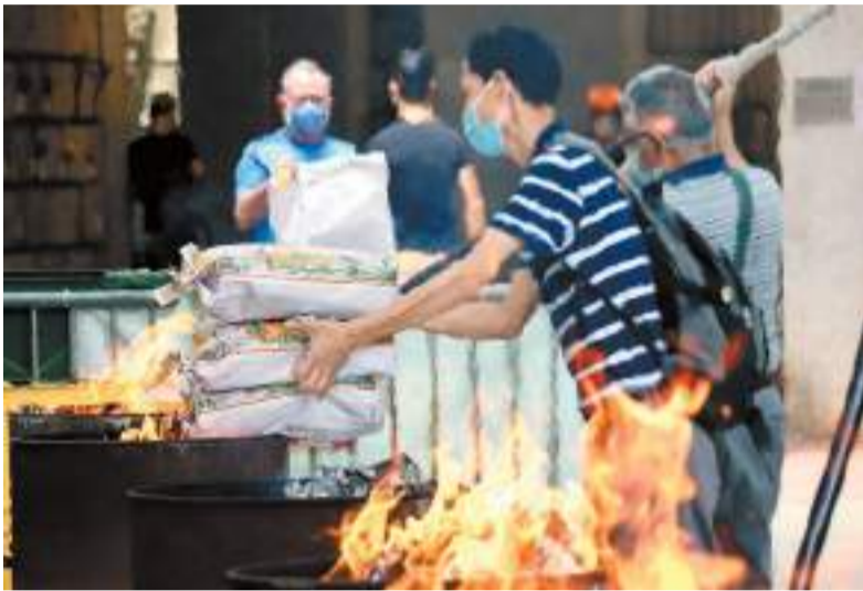
不少市民表示，今年購買祭品花費與往年相若。