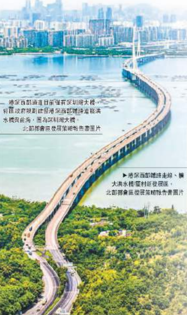
港西鐵路目前正興建深圳灣大橋，特區政府規劃建設港西鐵路連接洪水橋與前海，圖為深圳灣大橋。