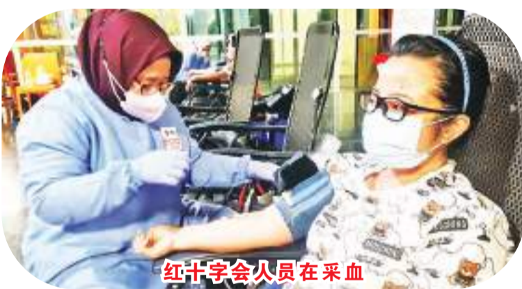
红十字会人员在采血