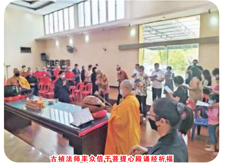
古禎法師率眾信于菩提心殿誦經祈福