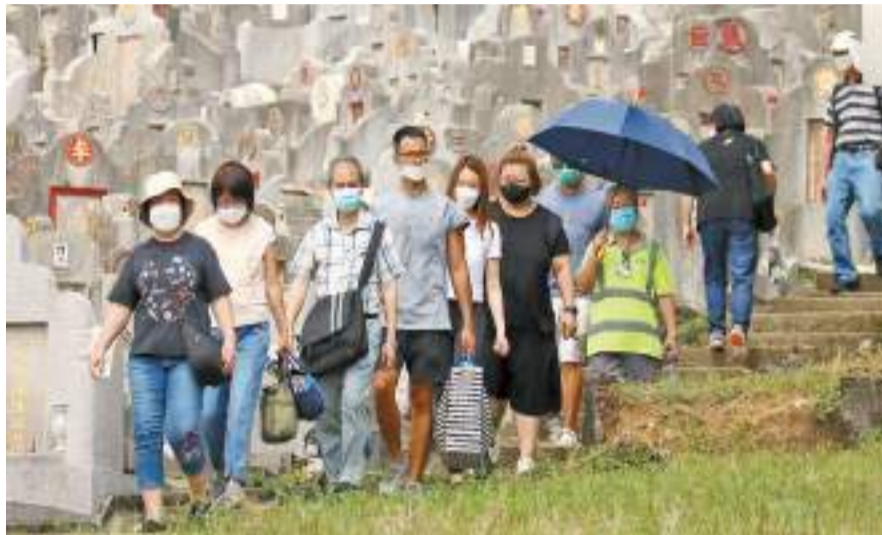
昨日雖是有紀錄以來最熱的重陽節，但無阻一眾孝子賢孫前往掃墓。記者 馮瀚文攝

【香港商報訊】記者唐信恒、區天海報道：昨日是重陽節，惟本港天氣炎熱。天文台昨清晨發出酷熱天氣警告，天文台總部下午一度錄得33.5度高溫，打破1959年32.5度舊紀錄，成為自1884年有紀錄以來最熱的重陽節。在酷熱天氣警告下，無阻一眾孝子賢孫前往掃墓。不少市民表示，今年購買祭品的花費與往年相若。