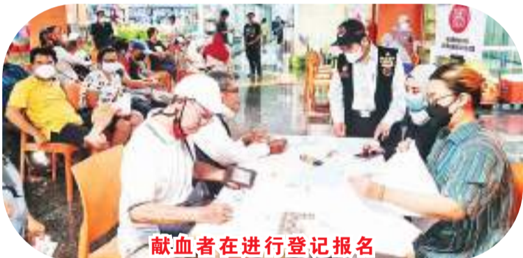
献血者在进行登记报名