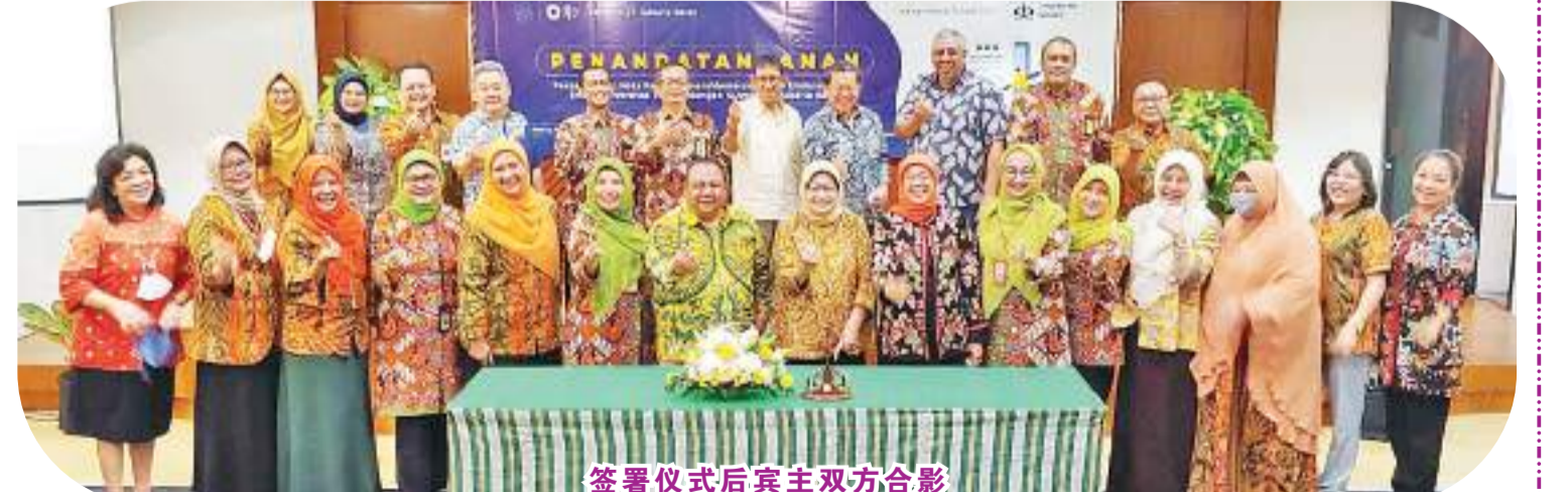
签署仪式后宾主双方合影

办事处与Trisakti大学签订合作协议。进行税务计划成立了Trisakti大学税务中心。今日签署谅解备忘录这是与大学税务中心协议有效期的续约延长。 除此外，本谅解备忘录中增加了扩展中小微企业税收和非税收发