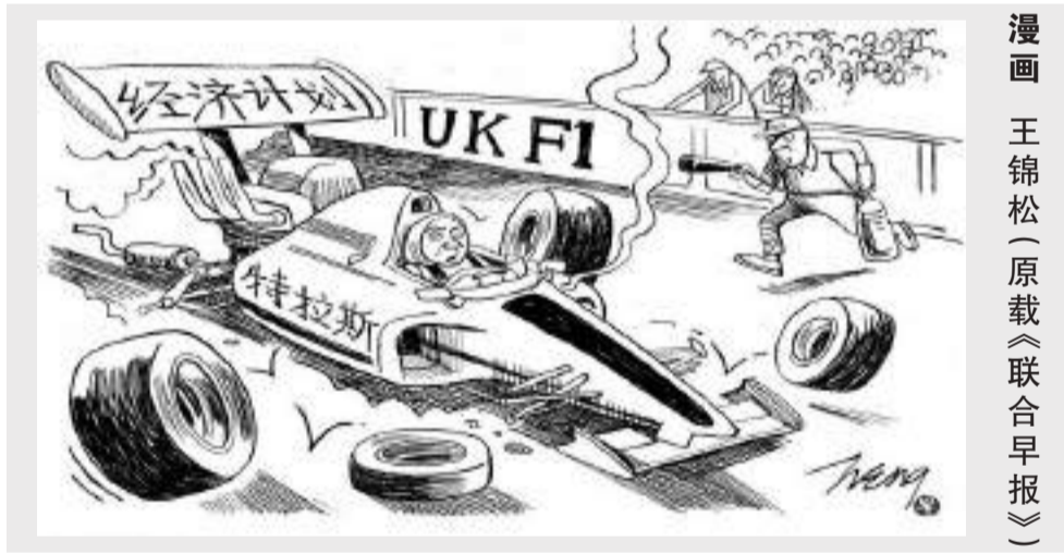
漫画 王锦松(原载《联合早报》)

特赋诗一首: 寻幽探胜画中游 远离尘嚣兴致稠 故里风光相去久 旅居水色梦归舟 时逢九九尊贤老 节至重阳孝道酬 传统习俗承古训 中华文化源远流