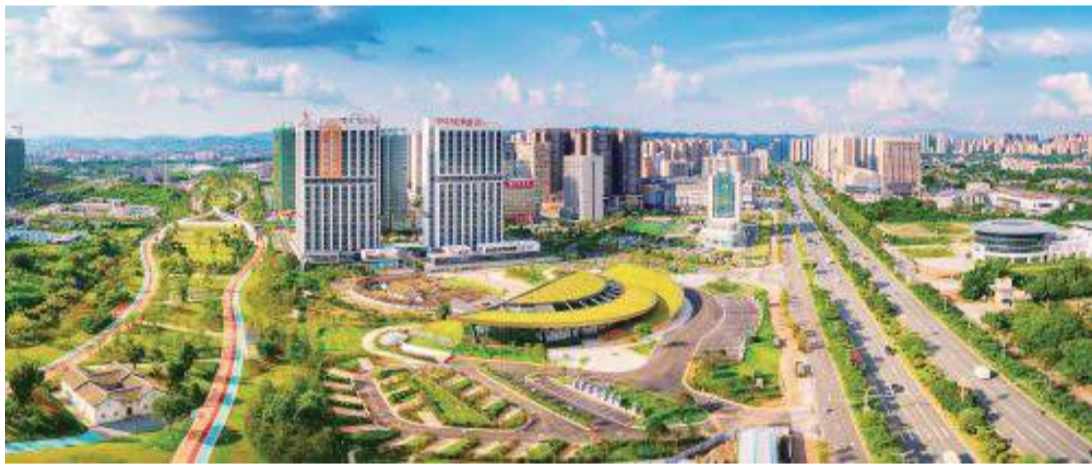
梅州城市功能日益完善，注重融合聯動，城鄉面貌煥然一新。

梅州是全國12個革命老區重點城市之一，也是廣東省唯一全域屬原中央蘇區範圍的地級市。過去十年，梅州全力爭取政策支持，接續將政策紅利轉化為振興發展成效，促使全市經濟社會發展取得矚目成就，基礎設施日趨完善，城鄉面貌煥然一新，老區蘇區人民生活越來越好。