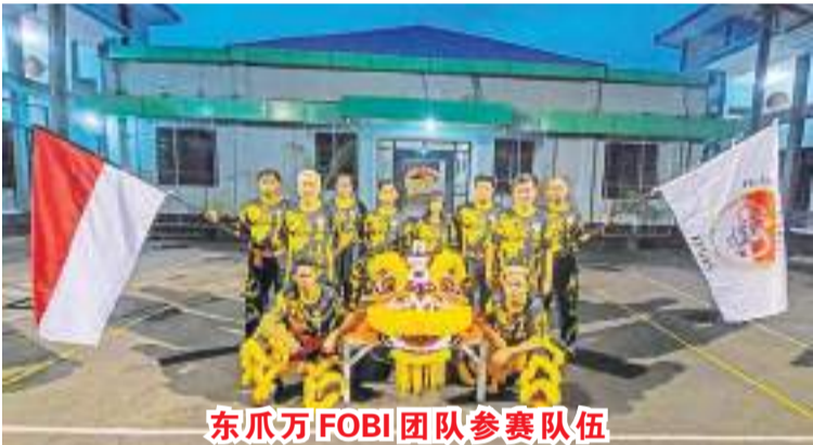
东爪哇FOBI团队参赛队伍

争。其中包括自由套路龙、结界龙、速龙、自由套路舞狮、强制套路舞狮、障碍舞狮、极速舞狮、跳桩杆舞狮、瑶洞技能舞狮、上推技能舞狮、极速北京狮和自由套路舞狮。 @Nto tze/HK