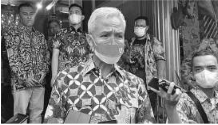
现任中爪哇省长甘贾尔

伍小惠表示,从一开始,甘贾尔一直就比其他人物更优越。全国的人民协商结果出现了9名候选人,包括马福、迪托、