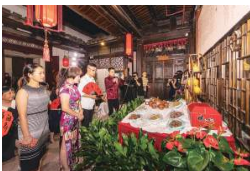
主持人向宾客介绍闽菜特色。

接下来，实验区仓山区块将围绕“一带一区一中心”(高端医疗服务带、药械研发制造区、生物技术创新中心)，打造现代医疗开放发展先行区、两岸医学医疗合作示范区、国际高端医疗机构集聚区、生物医药科技创新引领区。(林铭)