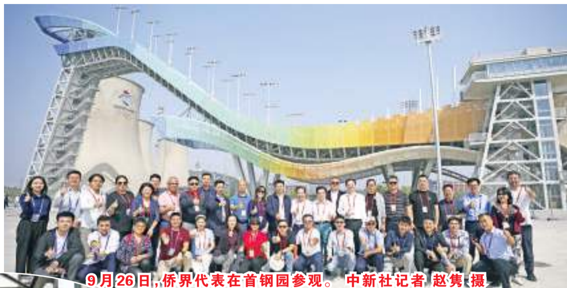
9月26日,侨界代表在首钢园参观。中新社记者 赵隽 摄

中新社北京9月27日电(记者 吴侃)受中国国务院侨办邀请,近百位侨界代表近日来京参加2022年国庆活动。