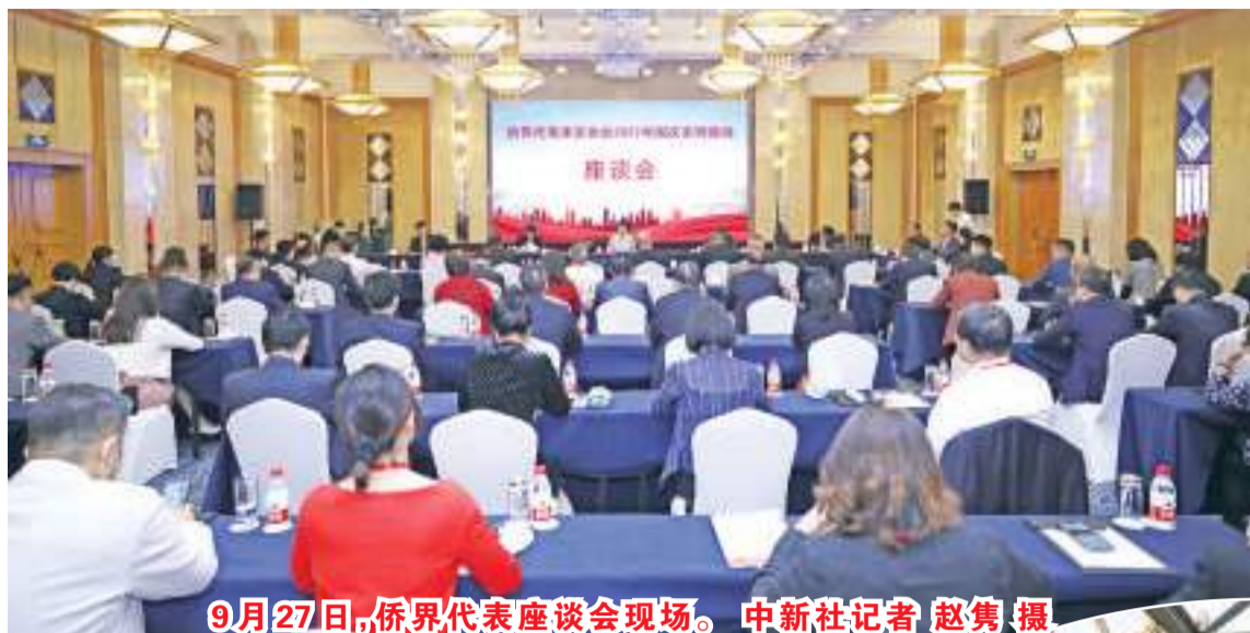
9月27日,侨界代表座谈会现场。