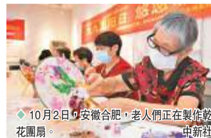
◆10月2日,安徽合肥,老人們正在製作乾花團扇。