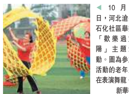
◀ 10月2日,河北滄州石化社區舉辦「歡樂過重陽」主題活動。圖為參加活動的老人在表演舞龍。