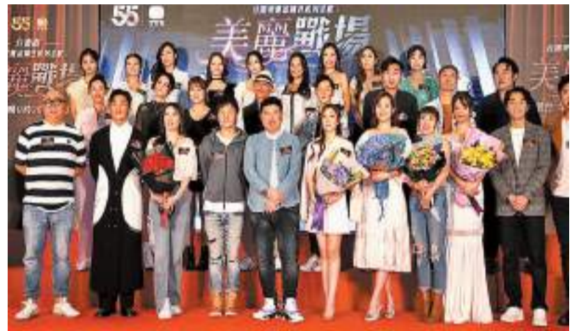
台慶劇《美麗戰場》前日在商場舉行宣傳活動。