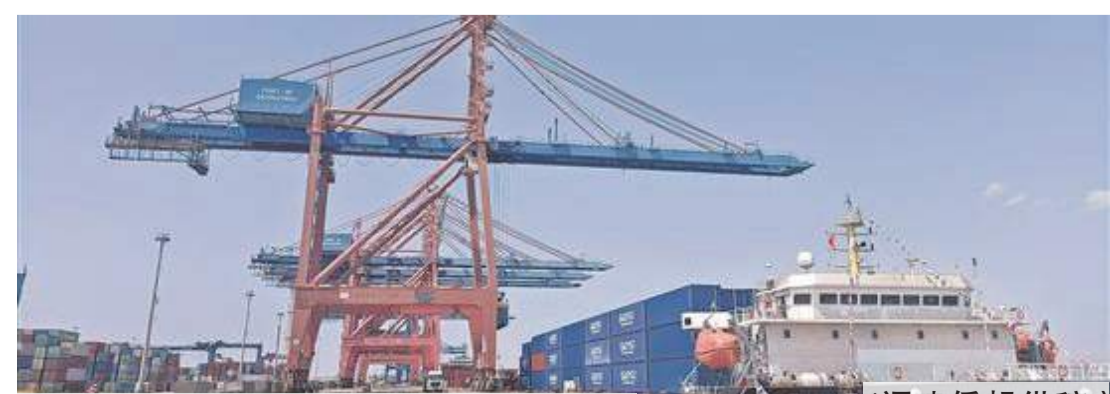
中國泉州—俄羅斯遠東航線開通，貨船裝滿集裝箱準備啟航。

目前，泉州石湖港已開通外貿航線12條，與廈門港初步形成遠近洋錯位發展格局。今年8月，港區完成集裝箱吞吐量12.9萬標箱，同比增長19.47%。其中，外貿集裝箱吞吐量完成9590標箱，同比大幅增長43.9%。