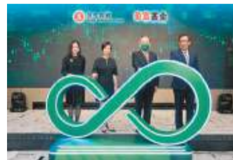
◆恒生投資管理今年9月19日起成為盈富基金新任經理人，並於同日為盈富基金引進新的人民幣交易櫃枱。資料圖片

多家上市公司表示將積極探索在港新增人民幣股票交易櫃枱，其中新世界發展行政總裁鄭志剛表示，新世界支持政府推動香港離岸人民幣業務的發展，相信有關安排可便利內地投資者未來以人民幣參與港幣通，有利深化離岸人民幣市場的流動性和深度，亦是進一步推動人民幣證券發行和交易，助力推展人民幣國際化的重要一環。