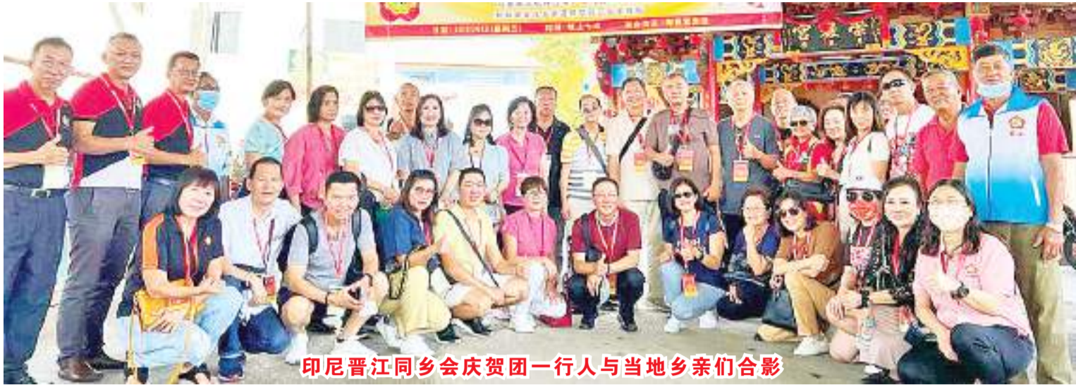
印尼晋江同乡会庆贺团一行人与当地乡亲们合影