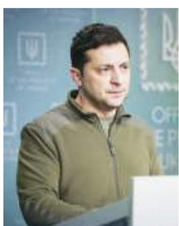
资料图:乌克兰总统泽连斯基

泽连斯基签署法令,批准了乌克兰国家安全和国防委员会关于不可能与俄罗斯总统普京进行谈判的决定。 根据这份文件,乌克兰方面在普京担任俄罗斯总统期间不可能与俄罗斯进行谈判。此外,乌克兰国家安全和国防委员会关于乌克兰申请快速加入北约的决定也获得通过。 据塔斯社9月30日报道,普京呼吁乌克兰立即停止敌对行动,重返谈判桌。他指出,俄罗斯多次表示愿意谈判。