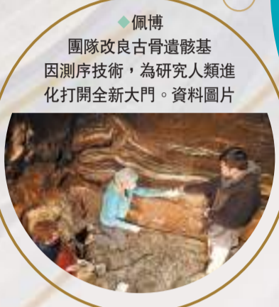
◆佩博團隊改良古骨遺骸基因測序技術，為研究人類進化打開全新大門。

諾貝爾評審委員會在新聞公報中指出，佩博透過他的開創性研究，完成看似不可能的創舉，為現代人類已滅絕的遠古親屬尼安德特人進行了基因組測序。他也因發現原始人類丹尼索瓦人而引起轟動。更重要的是，佩博發現在人類先祖於約70萬年前遷出非洲後，這些現已滅絕原始人類及智人(Homo sapiens)之間發生了基因轉移。古老基因轉移至現代人類，與今日的人類生理情況有相關性，並影響到現今人類的各方面，像是影響了人類免疫系統對感染的反應。藉着揭示所有區隔現存人類及已滅絕原始人類間的基因差異，他的發現為探索當代類人的獨特性奠定基礎。