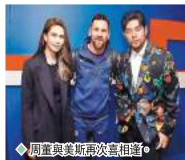
周董與美斯再次重逢。