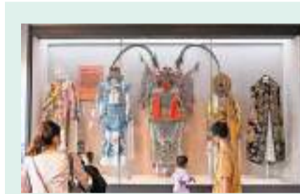
◆戶外露營、博物館遊等成為度假熱門選擇。圖為10月3日,市民參觀位於廣州市荔灣區永慶坊的粵劇藝術博物館。中新社

湖南、四川等省內火車線路預訂火熱。從出遊群體來看,以家庭、社群為主的出遊人數最多。戶外露營、博物館遊、主題樂園等成為親子遊群體的主要選擇。更多遊客選擇多次、多點出遊,三天以內出遊的人次預計佔比約55%,基於「臨時決策、本地探索、小眾玩法」的「即興度假」成為國慶假期新趨勢。