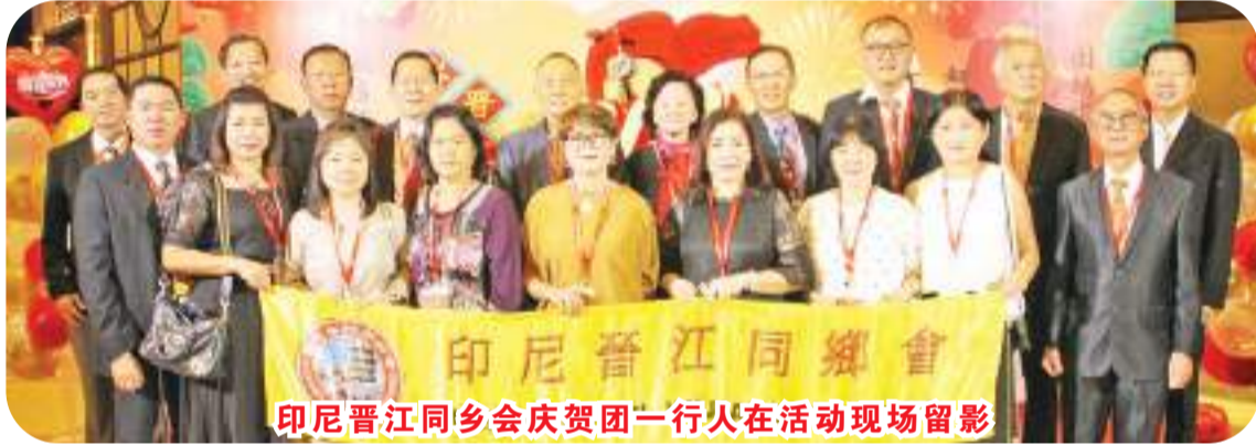
印尼晋江同乡会庆贺团一行人在活动现场留影