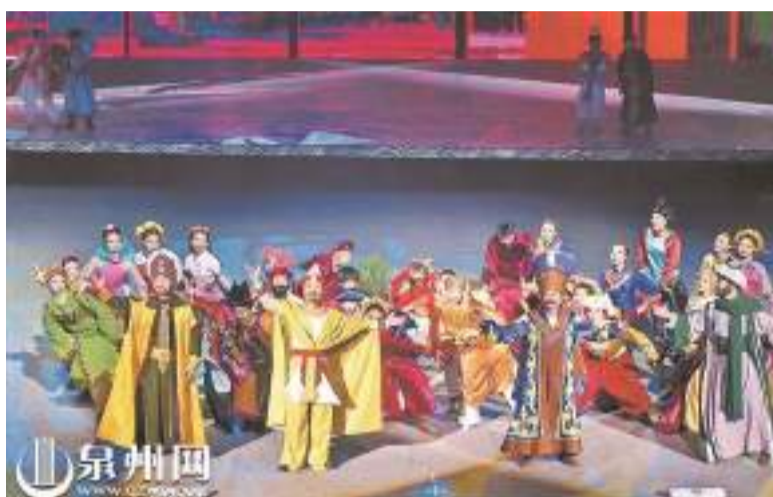
2017年，第三屆海上絲綢之路國際藝術節開幕式大型文藝演出在泉州舉行。

泉州網訊(記者 陳智勇)過去十年，作為古代海上絲綢之路重要起點城市的泉州，緊抓“一帶一路”建設這一歷史機遇，結合申報世界遺產等工作，從創建21世紀海上絲綢之路先行區，到建設21世紀“海絲名城”，發展的步伐越來越堅定。海絲文化的交流互鑒，進一步促進泉州與海絲沿線國家和地區的民心相通。