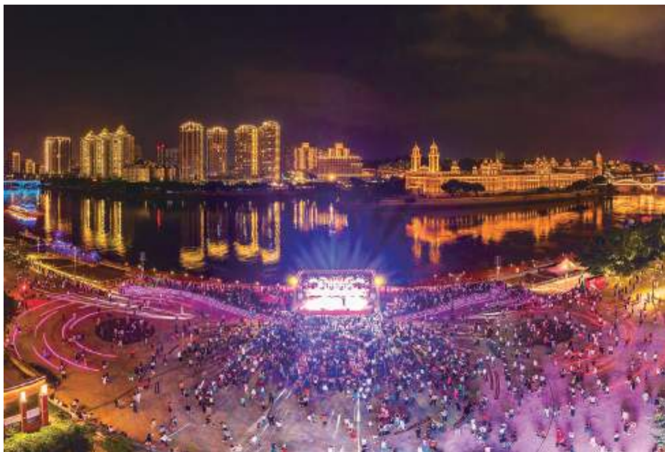
1日晚，海丝广场的演出吸引了众多市民。

国庆假期，闽江之心水中、岸上梦幻联动，许多福州市民乘坐游船欣赏闽江两岸风光和精彩灯光秀，20多场不同形式的文化活动在闽江之心南北两岸热闹开展，陪伴