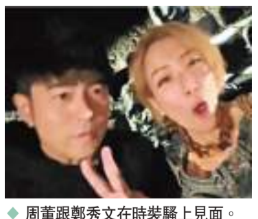
周董跟鄭秀文在時裝騷上見面。

香港文匯報訊 周杰倫(周董)與昆凌近日應邀赴巴黎欣賞時裝騷，周董還不忘藉機「集郵」。他在場跟鄭秀文(Sammi)碰上，兩人直呼「好久不見」，Sammi誇讚周杰倫瘦了，讓他一度害羞笑說：「哈哈！瘦了」，雙方互動十分有趣，過去兩人曾合作飲料廣告，引發大批粉絲興奮要求兩人再合作。另外，周董和昆凌還趁今次巴黎之旅，先後跟球王美斯及BigBang成員G-Dragon(GD)合照，馬上成為焦點。