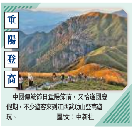
重陽登高 中國傳統節日重陽節前,又恰逢國慶假期,不少遊客來到江西武功山登高遊玩。圖/文:中新社

也就是說,自1953年起,上海百歲老人數量從1人到1,000人,用時58年;從1,000人到2,000人,用時6年;從2,000人到3,000人,用時僅3年。 從2000年到2021年,上海男性百歲老人年平均增長率高於女性,但增長絕對人數還是低於女性,即:男性百歲老人增長了827人,年平均增長率為15.52%;女性百歲老人增長了2,376人,年平均增長率為11.59%。