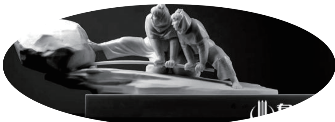
《同心協力》

泉州網訊(記者陳智勇)日前，第十五屆中國民間文藝山花獎頒獎典禮在浙江省杭州市舉行，惠安石雕《同心協力》榮獲優秀民間