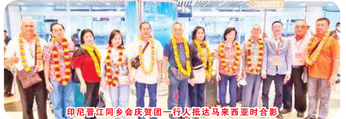
印尼晋江同乡会庆贺团一行人抵达马来西亚时合影