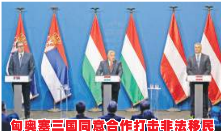
匈奥塞三国同意合作打击非法移民

制裁引起的反噬效应反而令欧洲能源供应紧张，天然气和电力价格飙升，整体通胀水平居高不下。多家媒体报道，欧盟国家不得不寻求以高昂价格向美国和卡塔尔等国购买液化天然气，同时增加从挪威和阿塞拜疆进口天然气以缓解供应紧张。