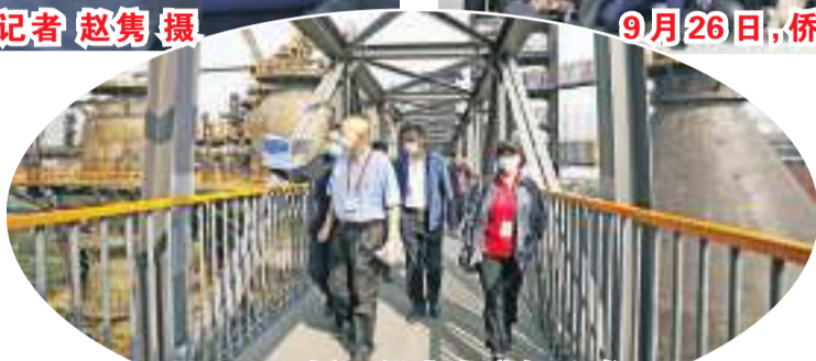
9月26日,侨界代表在首钢园参观。

进新征程、建功新时代”主题参观活动,并参加“当前中国经济形势”专题报告会。举行侨界代表座谈会,与会代表围绕“凝心聚力同圆共享中国梦,促进中外文化交流互鉴”进行主题发言,并对做好新时代侨务