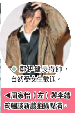
鄭伊健長得帥，自然受女生歡迎。