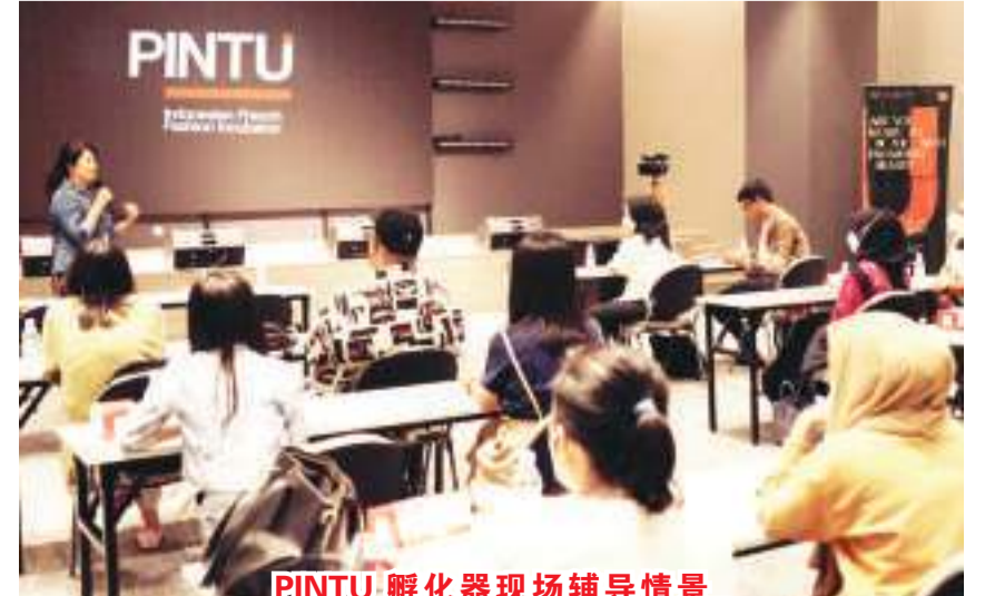
PINTU孵化器现场辅导情景