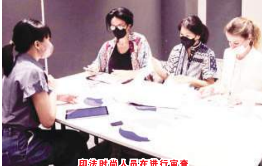
印法时尚人员在进行审查