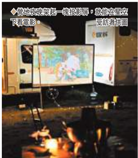
◆營地夜晚架起一塊投影屏,就能在星空下看電影。