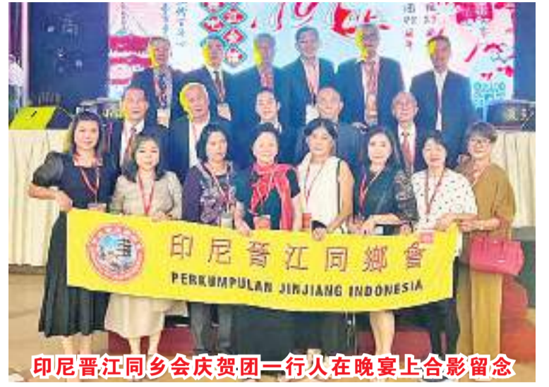
印尼晋江同乡会庆贺团一行人在晚宴上合影留念

【本报讯】应马来西亚峇株吧辖晋江会馆(Persatuan Jin Jiang Batu Pahat)之邀请,印尼晋江同乡会庆贺团在翁联泰常务副会长为团长的率领下,于9月29日至10月1日,一行19人赴大马参加当地晋江会馆成立101周年庆典。