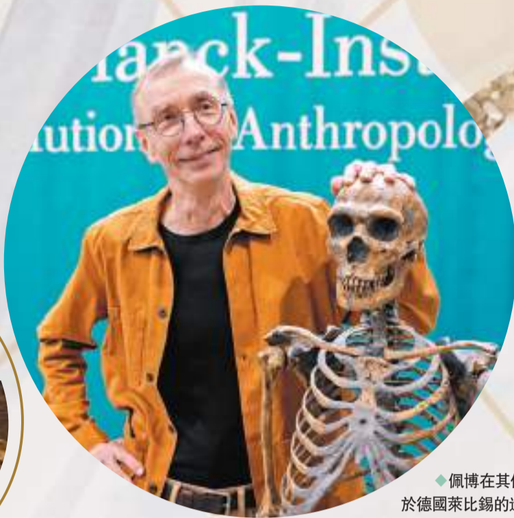
◆佩博在其位於德國萊比錫的進化人類學研究所召開記者會，慶祝奪得諾貝爾獎。

人類總是對自己的起源感興趣，會問到「我們從哪裏來」、「我們和我們的先輩有什麼關係」、「是什麼讓現代人類與古人類不同」，瑞典進化遺傳學權威佩博通過開創性研究，揭示所有現存人類與滅絕的古人類之間的基因差異，為探索「什麼使我們成為獨一無二的人類」提供了基礎。他藉着在已滅絕古人類基因組和人類進化研究方面所作出的貢獻，10月3日獲頒今屆諾貝爾生理學或醫學獎。