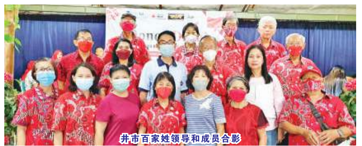
井市百家姓领导和成员合影