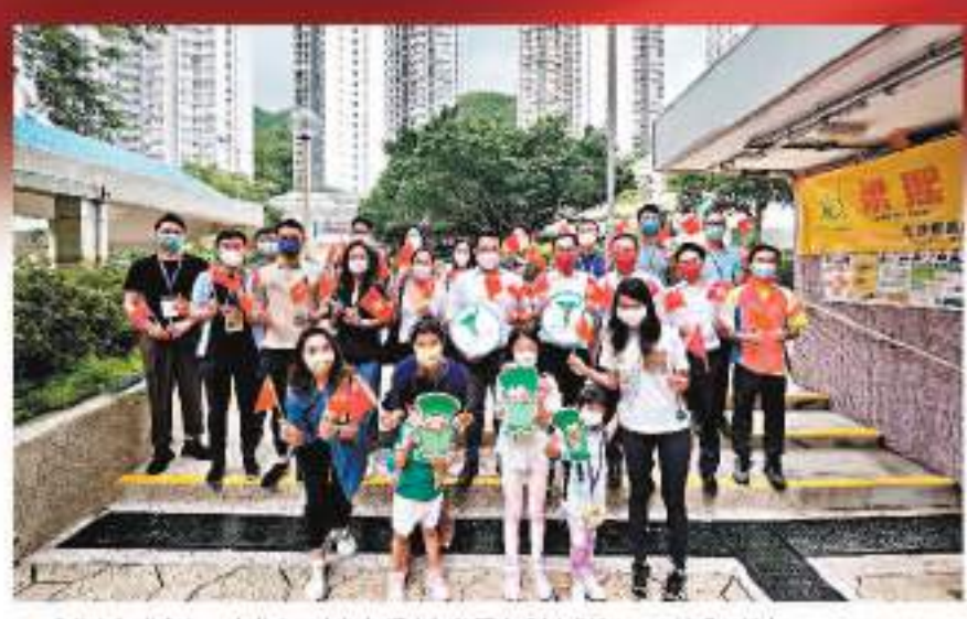
香港青年聯會與民建聯東區支部向觀塘東區各界派發的1,000份愛心禮包。

觀塘碼頭嘉年華 供港青擺攤 香港文匯報訊「青年興則國家興。」為協助一眾抱負大志的香港年輕人實現創業理想，九龍東區各界聯會、香港跑車界聯合會由1日到2日在觀塘碼頭碼頭聯合舉辦大型國慶嘉年華「創超航」。該作場為年輕人提供機會設攤位營運，展出其創業概念以及售賣各種商品，為年輕人創業打下根基。 該市場的攤位數目超過40個，包括手工飾物以及傳統工藝等攤位，匯集了各界青年的創業概念，於指定攤位展出不同比賽中得獎的優秀創業概念，並由創業者現場分享其概念，包括網絡媒體以及餐飲管理等，讓市民了解新一代青年的想法以及創業理念，更可以為本地青年尋得資助機會，協助其實現理想。 香港跑車界聯合會會長陳國強表示，「創超航」是為年輕人提供一個展示其創業概念的舞臺，也是為他們提供一個與社會各界交流的機會。他呼籲社會各界人士踴躍支持，為年輕人提供一個展示其創業概念的舞臺，也是為他們提供一個與社會各界交流的機會。