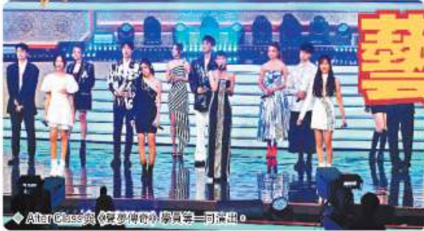
After Class與《聲夢傳奇》學員等一同演出。