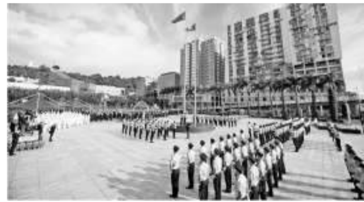
10月1日，澳门特别行政区政府在金莲花广场举行升旗仪式，庆祝中华人民共和国成立73周年。