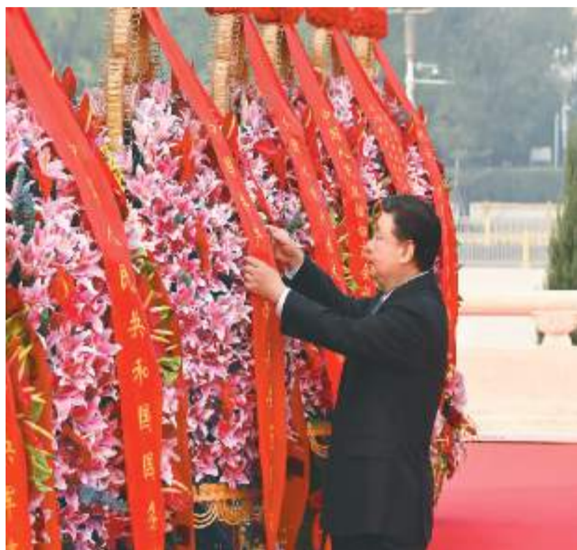
9月30日上午,党和国家领导人习近平、李克强、栗战书、汪洋、王沪宁、赵乐际、韩正、王岐山等来到北京天安门广场,出席烈士纪念日向人民英雄敬献花篮仪式。这是习近平整理花篮上的缎带。