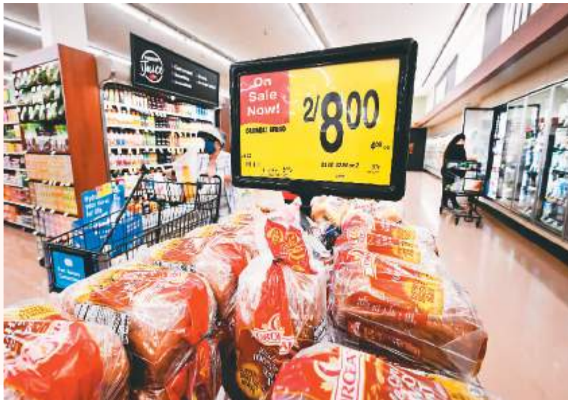
美国全国商业经济协会8月22日发布的问卷调查结果显示，七成受访者对美联储在不引发衰退的前提下把通胀降至目标水平没有信心。图为近日在美国蒙特贝洛一家超市内拍摄的价格标签。

对此，世界银行警告称，全球范围的“加息潮”将把全球经济推向衰退，尤其是发展中国家将面临一连串的金融危机风险和“持久伤害”。