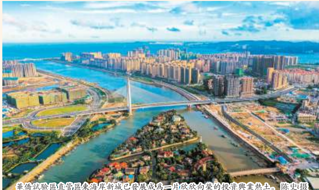
華僑試驗區直管區東海岸新城已發展成為一片欣欣向榮的投資興業熱土。

白紙畫卷，精雕細琢繪新城藍圖。自設立以來，華僑試驗區把加快基礎設施建設作為“築巢引鳳”的發展戰略之一，提前謀劃、超前布局，不斷完善功能配套。伴隨著開發建設的聲聲鼓點，直管區東海岸新城已建成總長超110公里的市政主幹道，總面積980多畝的津灣公園、東海岸公園、紅樹林公園，2所九年一貫制學校、1所國家示範性高中和