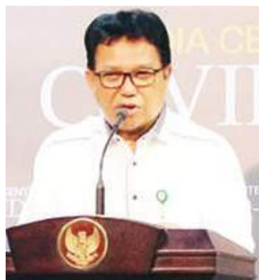
卫生部发言人穆罕默德·夏里尔(Mohammad Syahril)。

【本报讯】卫生部表示,只有在世界卫生组织(WHO)正式撤销新冠肺炎病毒大流行病的情况下,印度尼西亚才能发布自由摘除口罩的政策。周三(28/9),卫生部发言人穆罕默德·夏里尔(Mohammad Syahril)指出,希望民众将戴口罩成为一种新的文化,因为那是清洁和健康生活行为的模式之一。防疫卫生规则是为我们自己准备的,如果新冠肺炎已成为地方病的话,就可以随意戴口罩或取下,已不是强制性的了。夏里尔表示,如果稍后宣布新冠肺炎大流行结束了,这也不会立即使新