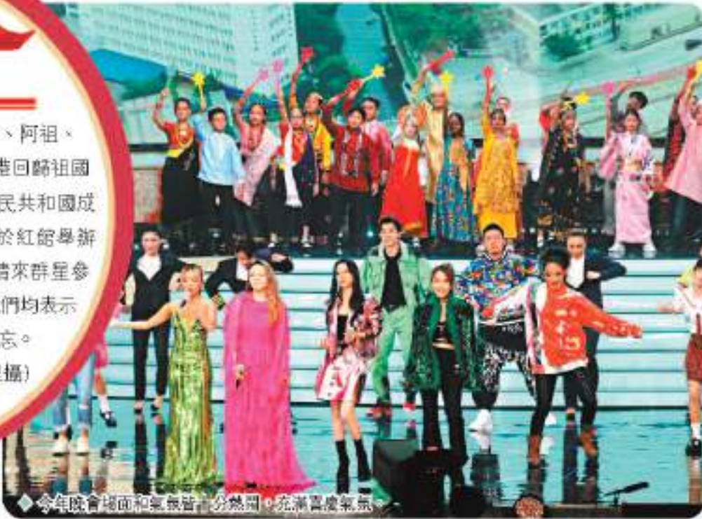
今年晚會場面熱鬧,氣氛分外熱烈,充滿喜慶氣氛。