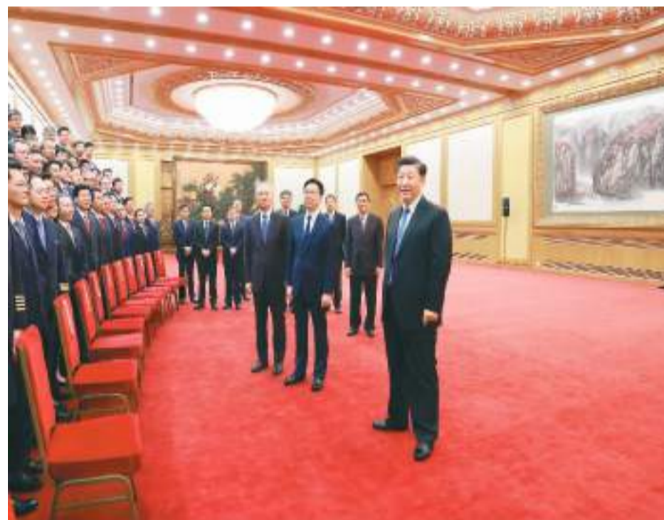
九月三十日,党和国家领导人习近平、韩正等在人民大会堂会见C919大型客机项目团队代表并参观项目成果展览。这是习近平等会见C919大型客机项目团队代表。

新华社北京9月30日电 中共中央总书记、国家主席、中央军委主席习近平30日上午在北京人民大会堂会见C919大型客机项目团队代表并参观项目成果展览,充分肯定C919大型客机研制任务取得的阶段性成就。他强调,让中国大飞机翱翔蓝天,承载着国家意志、民族梦想、人民期盼,要充分发挥新型举国体制优势,坚持安全第一、质量第一,一以贯之、善始善终、久久为功,在关键核心技术攻关上取得更大突破,加快规模化和系列化发展,扎实推进制造强国建设,为全面建设社会主义现代化国家、实现中华民族伟大复兴的中国梦不懈奋斗。(下转第二版)