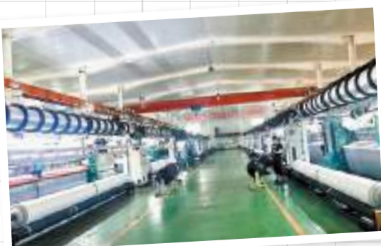
◆金冠網具有限公司生產線。