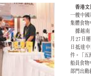
第五屆進博會食品及醫療展區展前供需對接會前在上海舉行。

憑藉優異的性能表現和產量優勢，蘭特的超薄柔性玻璃產品備受中國手機廠商青睞，已經從2019年初登進博會舞臺，到如今作為成熟產品出现在了無數消費者的手機上，真正實現了進博會「展品變商品」的初衷。作為世界領先的精品集團之一，歷峰集