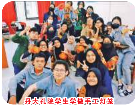
丹大孔院学生学做手工灯笼