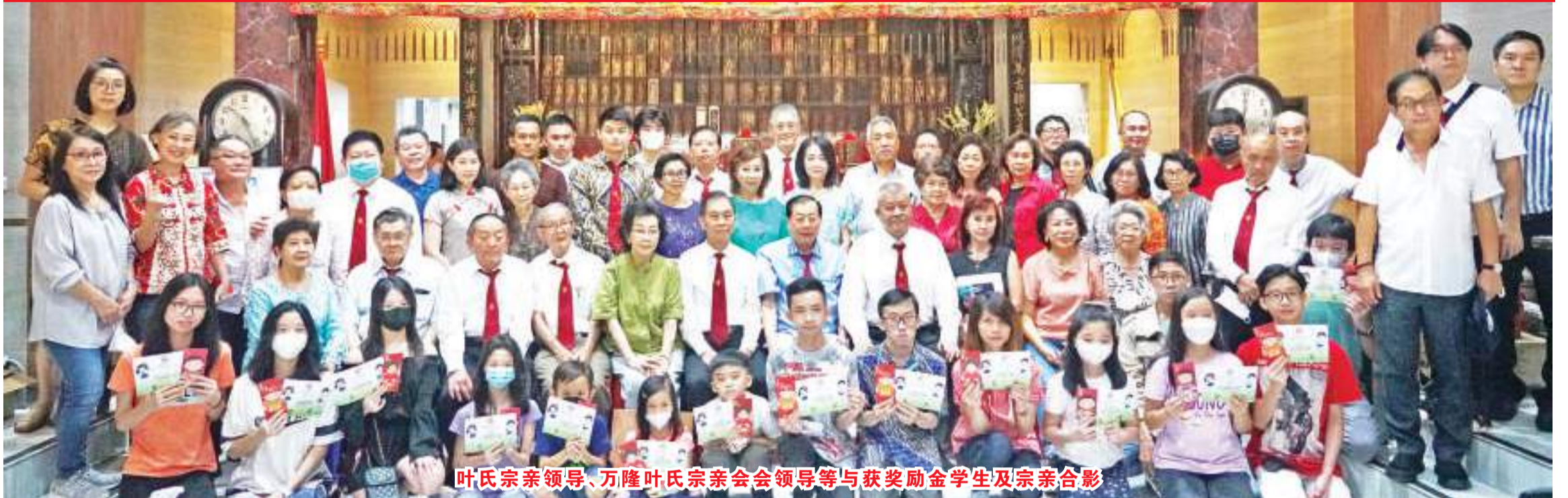
叶氏宗亲领导、万隆叶氏宗亲会会领导等与获奖励金学生及宗亲合影