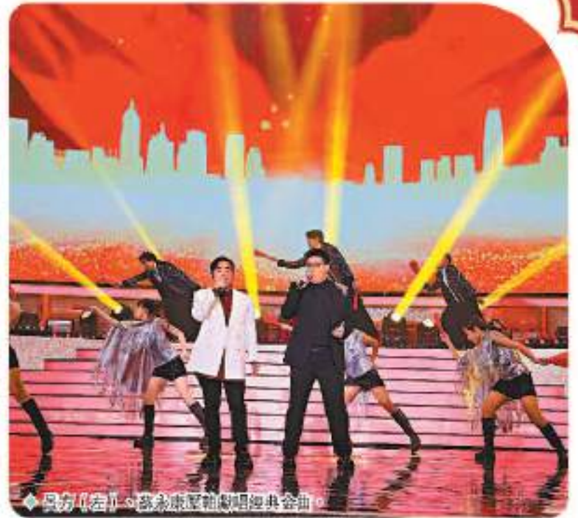
吳芳琪(左)、蘇永康(右)聯唱經典金曲。