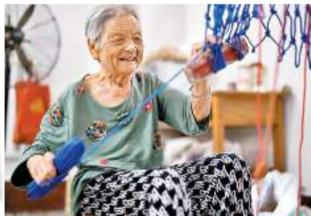
◆91歲的老太太在編織繩網。