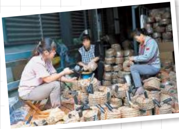
◆工人給拔河繩打包。