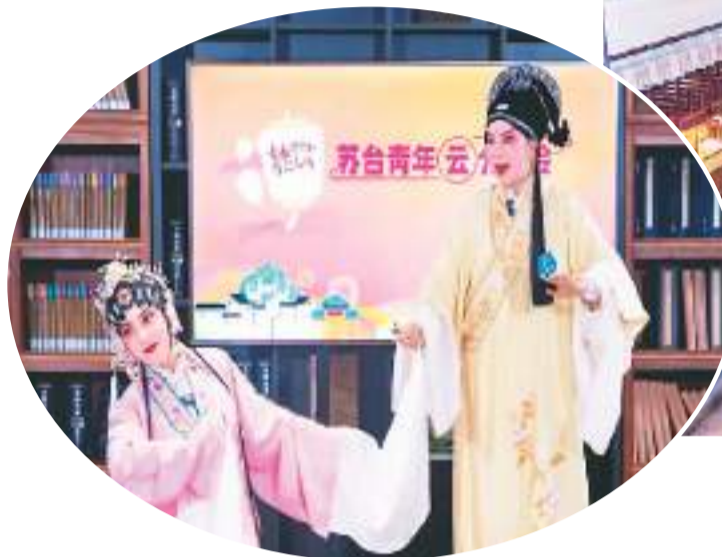
苏台青年分享会上的昆剧表演。

演绎京昆之美、“云游”江南古镇、品尝宝岛美食……江苏近期推出海峡两岸青年文化月、苏台青年分享会等一系列两岸交流活动，通过线上线下相结合的方式，邀请江苏台湾两地青年共赴文化交流之约，弘扬中华文化，增进心灵契合。