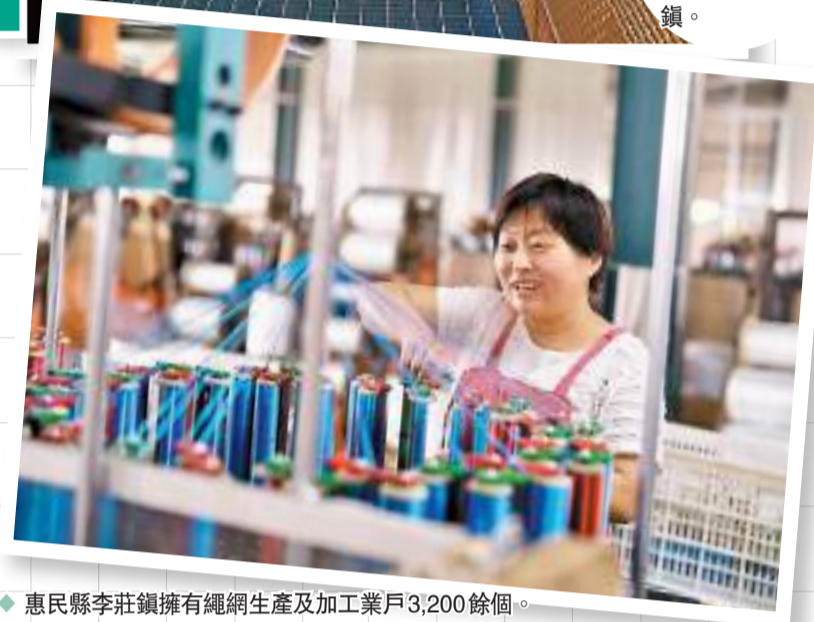
◆惠民縣李莊鎮擁有繩網生產及加工業戶3,200餘個。

據悉，自李莊鎮2020年開始涉足海參養殖網迅速佔領市場，目前已佔市場的半壁江山。而這種傳統繩網的替代升級，最直觀的就是利潤的提升。以漁具為例，傳統繩網的利潤一般只有3%-5%，漁具的利潤在40%以上。