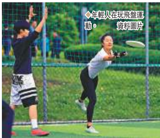
年輕人在玩飛盤運動。