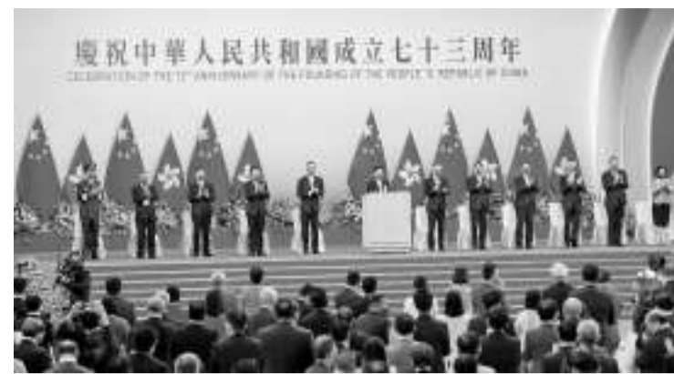
10月1日，香港特区政府举行隆重的升旗仪式和酒会，庆祝中华人民共和国成立73周年。