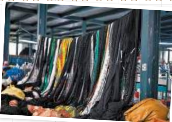
◆李莊生產的繩網涵蓋8大系列300多種繩網產品。

目前，全鎮電商數量達到3,600餘家，線上交易額突破25億元。李莊鎮連續5年被評為中國淘寶鎮，成功培育21個中國淘寶村，總數為濱州市第一、山東省第三。