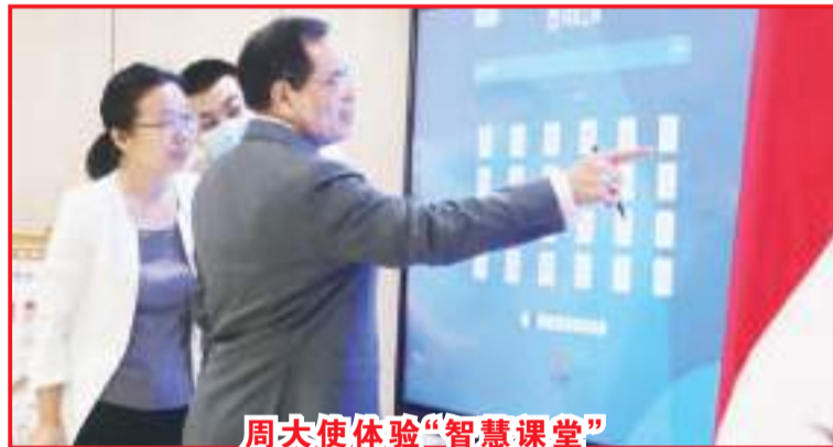
周大使体验“智慧课堂”