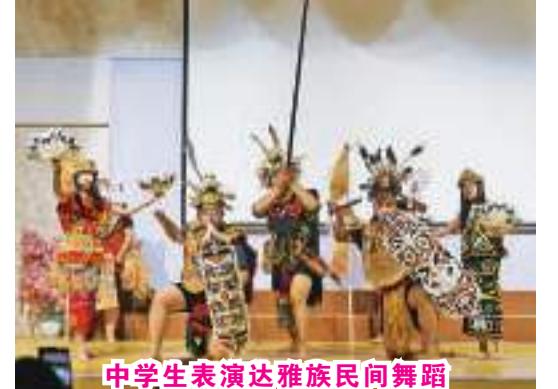
中学生表演达雅族民间舞蹈