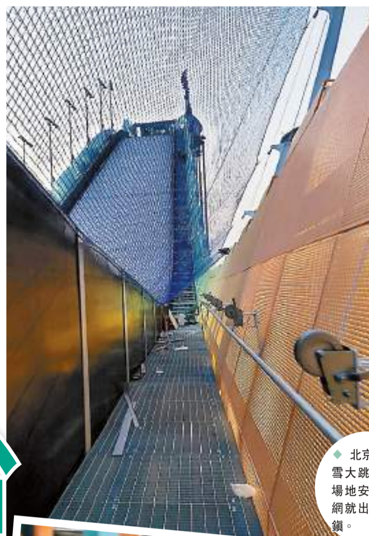
◆北京首鋼滑雪大跳台中心場地安全防護網就出自李莊鎮。