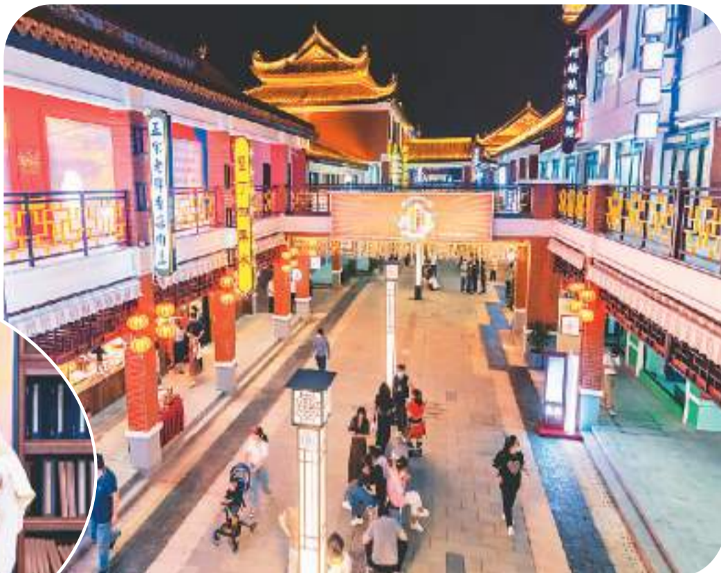
昆山“宝岛又一村”文旅商业街。