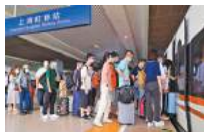
10月1日，旅客在鐵路上海虹橋站乘車。

泗水縣供電公司積極配合當地鐵路部門，組織工作人員對管內日蘭高鐵沿線供電線路進行巡視檢查，及時消除用電隱患。