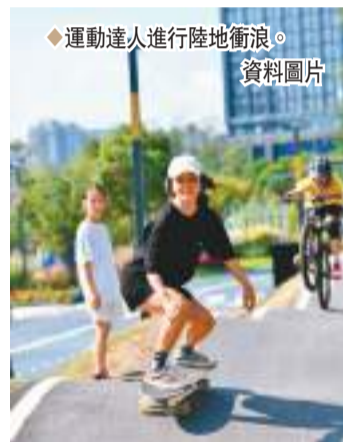
運動達人進行陸地衝浪。