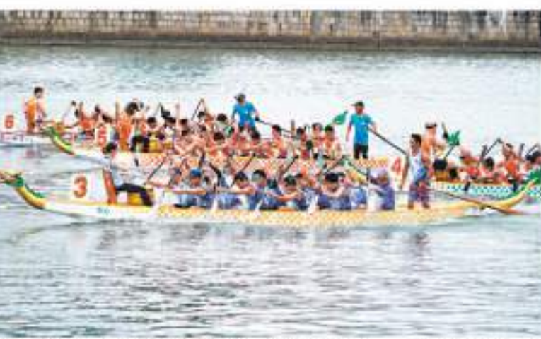
中國海外愛心基金會策劃首屆「中海盃」愛心龍舟同樂賽。

「西貢區弘揚中華文化匯演」1日舉行，其中天主教曉鳴中學以粵語演說唐韻著名人物楊貴妃、武則天等。