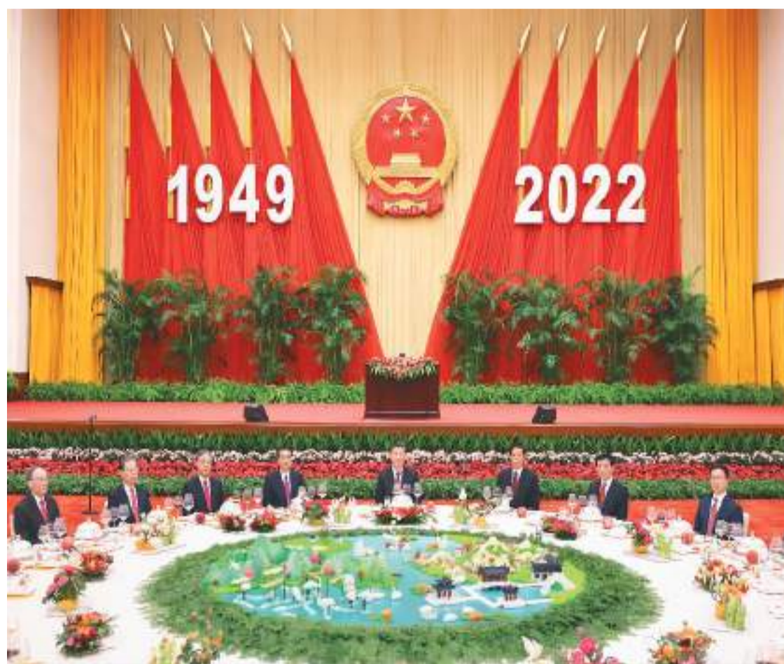
9月30日晚,国务院在北京人民大会堂举行国庆招待会,热烈庆祝中华人民共和国成立七十三周年。习近平、李克强、栗战书、汪洋、王沪宁、赵乐际、韩正、王岐山等党和国家领导人与中外人士欢聚一堂,共庆共和国华诞。

新华社北京9月30日电 9月30日晚,国务院在人民大会堂举行国庆招待会,热烈庆祝中华人民共和国成立73周年。习近平、李克强、栗战书、汪洋、王沪宁、赵乐际、韩正、王岐山等党和国家领导人与近500位中外人士欢聚一堂,共庆共和国华诞。 (下转第三版)