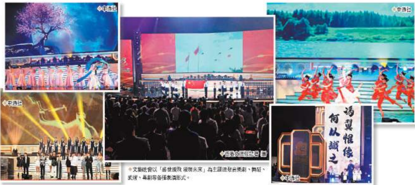
文藝晚會以「盛世騰飛 璀璨未來」為主題匯集音樂劇、舞蹈、武術、粵劇等各種表演形式。

國慶73周年 香港文匯報訊 為祝賀中華人民共和國成立73周年及香港回歸祖國25周年，以「盛世騰飛 璀璨未來」為主題的「國慶文藝晚會」於1日晚舉行。晚會匯聚音樂劇、舞蹈、武術、歌頌、粵劇、音樂演奏等一系列精彩及多元化的表演節目，在展示國家偉績的同時，突顯香港在國際體壇、文化藝術的成就。