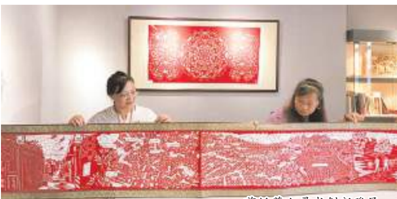
剪紙藝人尋求創新發展。

剪紙作為傳統民間藝術之一，其興起、發展與人們的生活密不可分。以前，每逢傳統節日、壽辰、婚姻嫁娶，都用剪紙貼飾在禮品上，多表現吉祥喜慶、福祿壽誕、五福呈祥、子嗣綿延、五谷豐登、六畜興旺等祥瑞題材，以渲染喜慶氣氛。如今，剪紙在創新中傳承，被制成壁掛、“印”在杯子、扇子、燈具上，做成旅游紀念品或者獨具地方特色的手信，極大地增加了剪紙作品的附加值，同時也廣受歡迎。剪紙藝人們傳承技藝、開拓創新之餘，也積極致力於培養傳承接班人，進校園、進社區等活動持續開展，傳統技藝的未來發展正等待著新一代接班人繼續書寫。