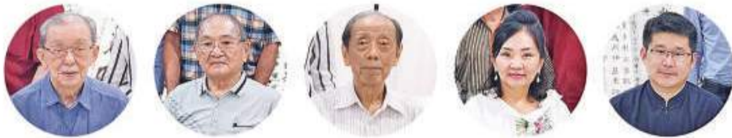
五位评审，左起：董樵、杨煌林、张喜顺、丘慧、王玉斌

我国知名书法前辈91高龄的董樵老师、83岁的杨煌林老师、80岁的张喜顺老师，以及印尼著名书画家丘慧导师。此外组委会还特邀法国书画家协会副主席王玉斌先生为评审团队成员。本评选委员会，是根据书法创作的笔法、章法、规格和布局，以公平、公正的原则对每一幅作品进行评审。