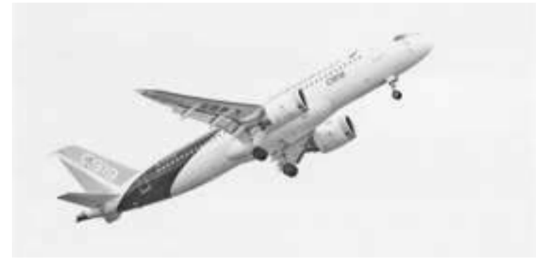
7月18日在陕西省蒲城县拍摄的C919大飞机的试飞。

“中国和尼日利亚有着非常诚挚友好、互惠互利的关系。”西里卡说。路透社称，作为非洲人口