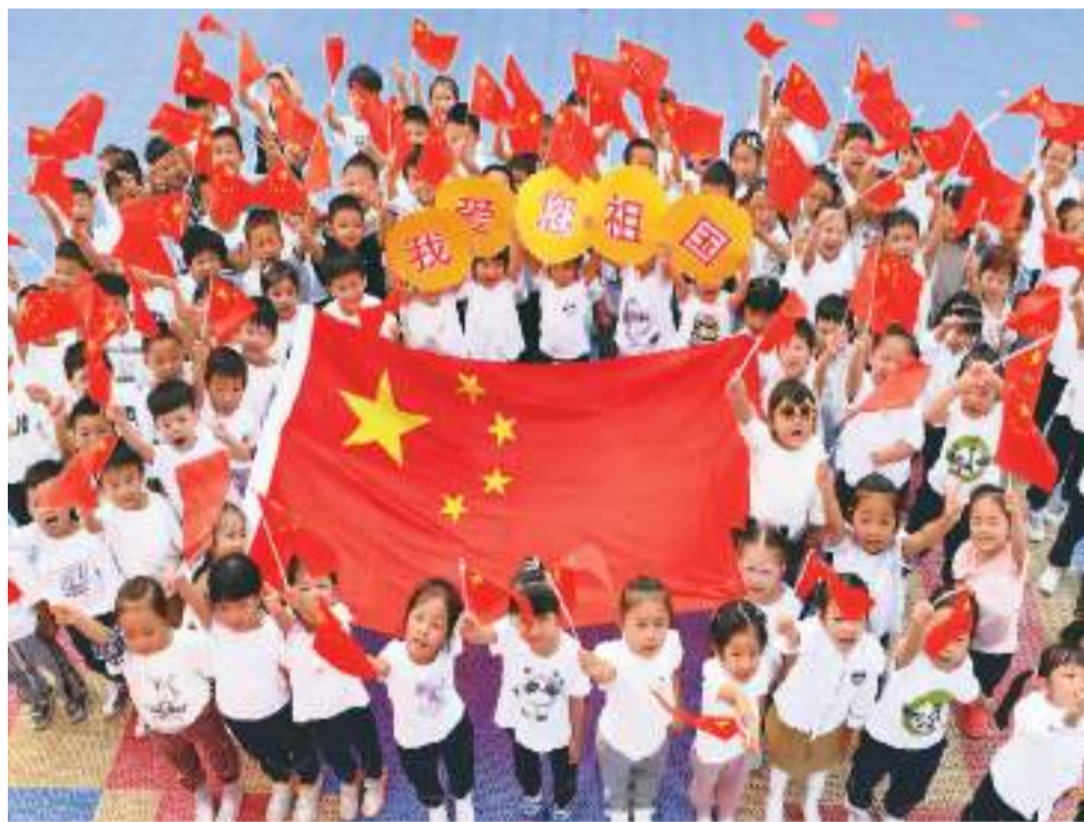
近日，河北省邯郸市丛台区北斗童星幼儿园的孩子们举行“我和国旗合个影”主题活动，表达对伟大祖国的热爱和美好祝福。