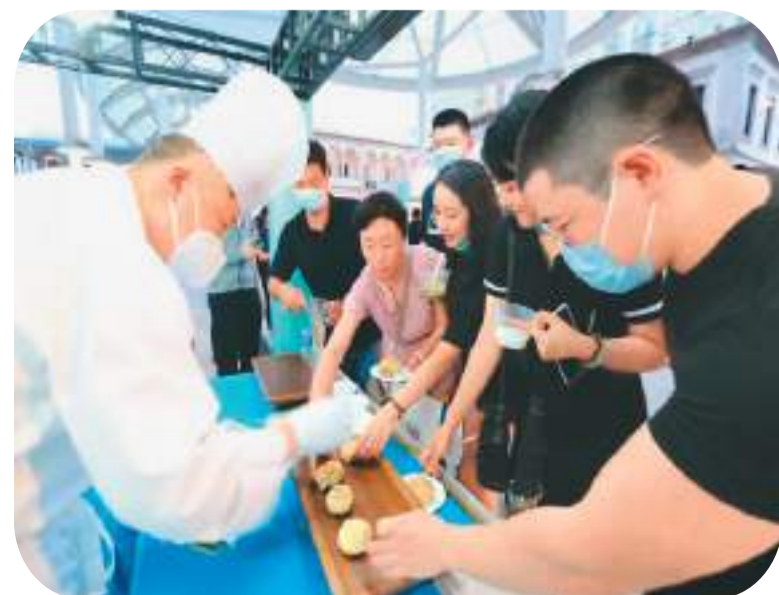
在“孔子家乡 好客山东”文化旅游（澳门）推广周活动中，澳门市民现场品尝山东美食，感受山东美食文化。