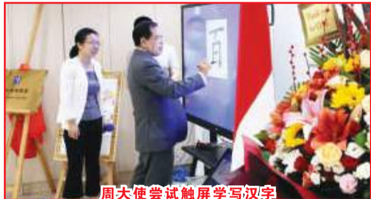
周大使尝试触屏学写汉字

尼讲师在职业领导力、创新学习技术上进行了培训，还提供了本科、硕士和博士中文教育奖学金的资助。同时，周浩黎表示大使馆也将继续鼓励在中国