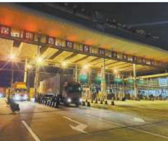
深圳鹽田綜合保稅區北開實施24小時通行。

接下來，深圳鹽田綜合保稅區將深度融入大灣區發展大局，積極貫通兩個大市場，精準服務雙循環，為鹽田全球海洋中心城市核心區和沙頭角深港國際旅遊消費合作區建設貢獻新的更大力量。