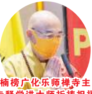
楠榜广化乐师禅寺主 寺释学进大师祈祷祝福