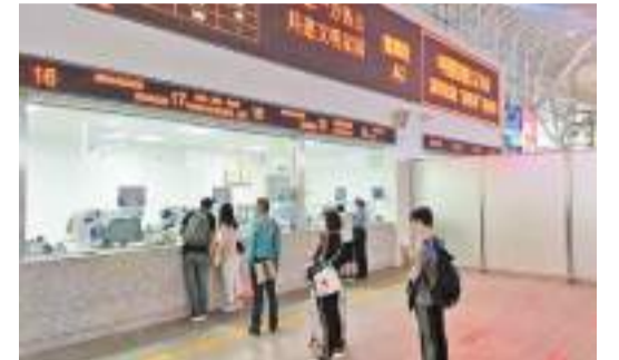
深圳北站乘客售票服務窗口。

2023年春運節後返程團體票的乘車日期為2023年1月25日至2月8日。可預訂的範圍為：湖南地區與其他地區部分始發列車硬座、軟座返程車票（含部分長沙南、懷化南站至深圳北站高鐵二等座）。