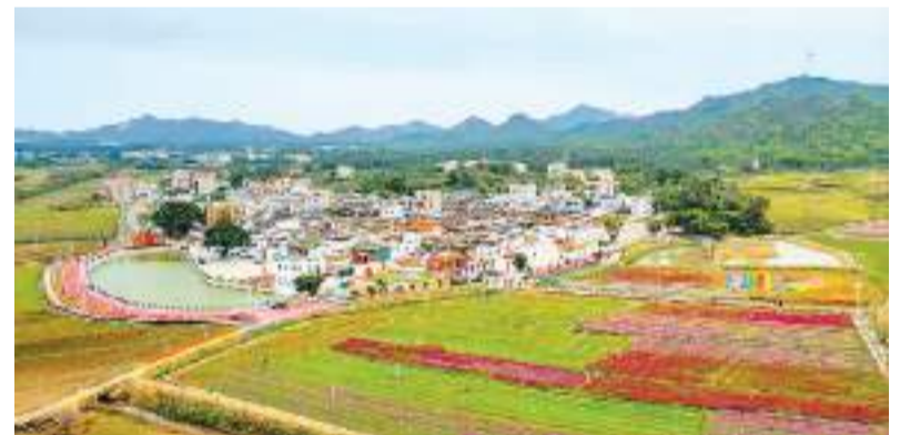
广东省汕尾市陆丰乡村振兴“浪漫荷香”景观示范带重要节点桥畔镇溪碧村。