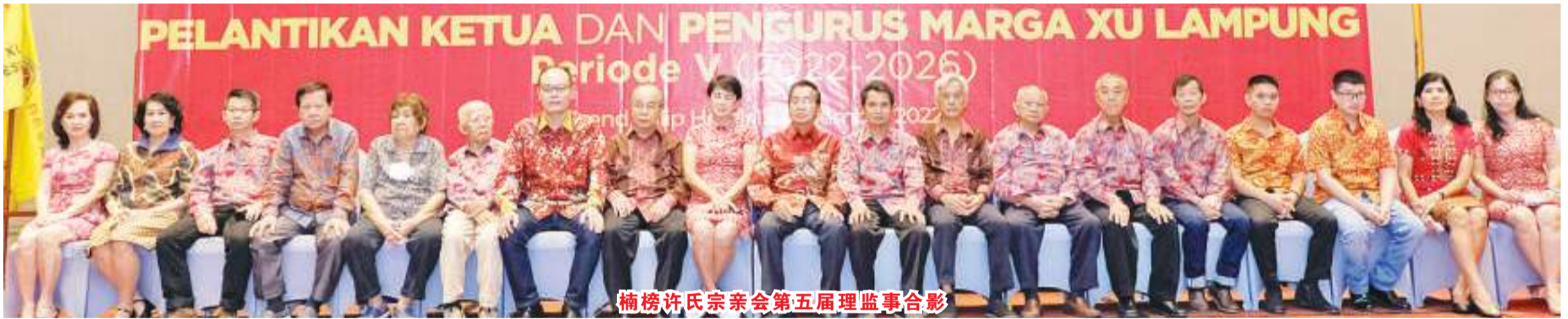
楠榜许氏宗亲会第五届理监事合影