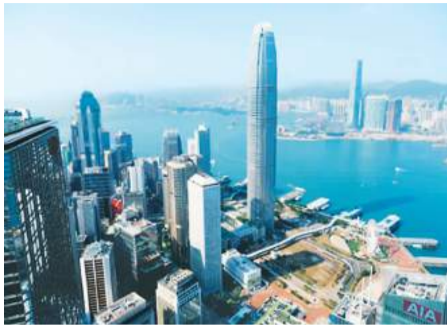
图为香港维多利亚港两岸。

会议期间，由招商局集团旗下招商轮船发起，40家相关企业和机构共同参与的《航运绿色能源倡议宣言》发布。该宣言倡导航运绿色能源产业链的各方共同行动起来，为航运业提供可供加载绿色燃料的基础设施，加快船舶使用绿色燃料的进程，努力实现海事减排低碳目标。