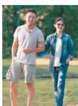
◆大S與汪小菲已變成怨偶。