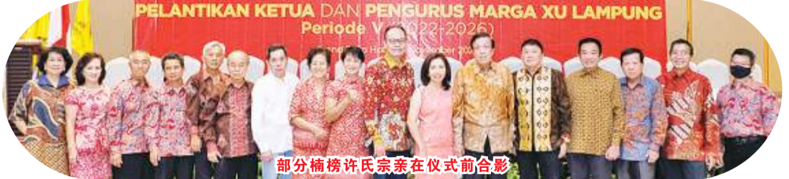
部分楠榜许氏宗亲在仪式前合影