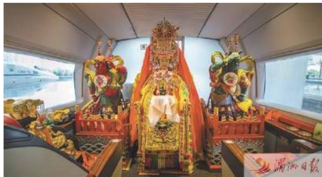
2019年,媽祖金身從湄洲島媽祖祖廟出發,乘動車移駕江蘇和上海開展巡安布福活動。

北宋宣和四年(1122),官員路允迪奉旨出使高麗,在東海遭遇大風,船艙紛紛傾覆,祇剩路允迪的船還沒翻。他連忙求天庇佑,接著就見一名身著紅衣的神女出現在桅杆上,路允迪磕頭請求幫助,風波隨之止息,同行者說這是莆田聖墩人信仰的湄洲神女顯靈。1123年,聽聞相關奏報的宋徽宗遂下旨為聖墩媽祖廟賜“順濟”匾額。這個故事被稱為“朱衣着靈”,是媽祖首次得到皇帝的認可,一舉奠定了媽祖成為國家海神的