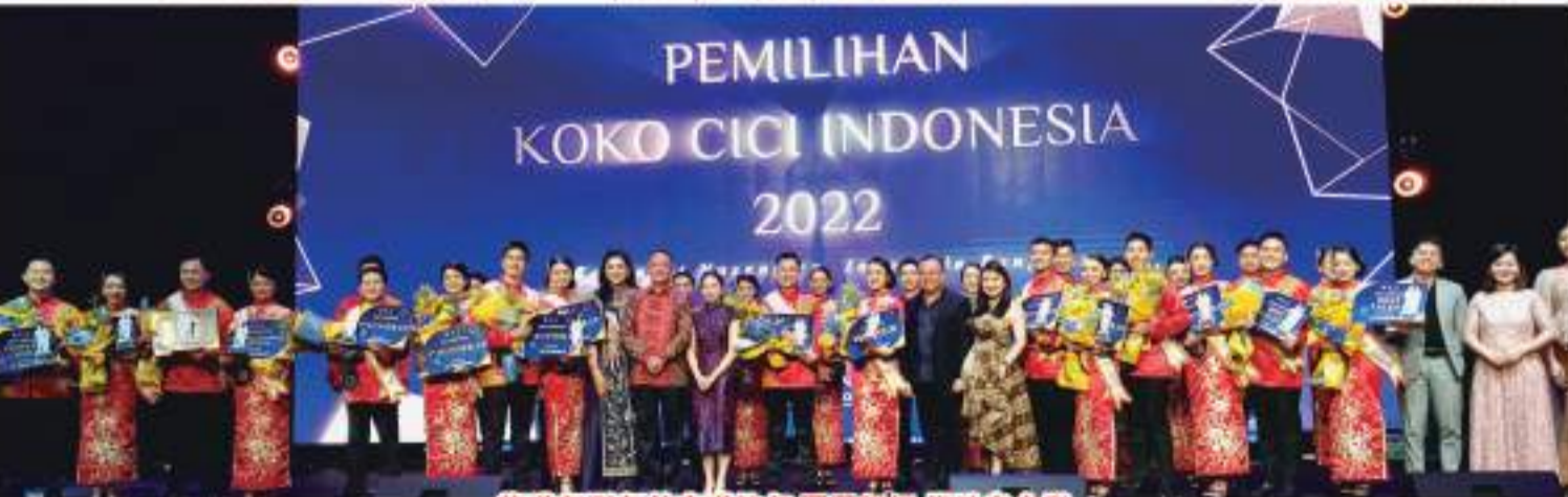
旅游部副部长安琪拉与哥哥姐姐优胜者合影

Tarumanagara 基金会现在是达国新雅学院的主要相关利益者。达国新雅学院校址位于西雅加达丹绒榴莲的Tarumanagara大学内。达国新雅学院附属福建师范大学和华侨大学来培养学生,通过学习计划为学生提供普通话技能,即普通话商务与旅游 2+2(印度尼西亚2年,中国2年)与学习普通话教学3+1(印尼