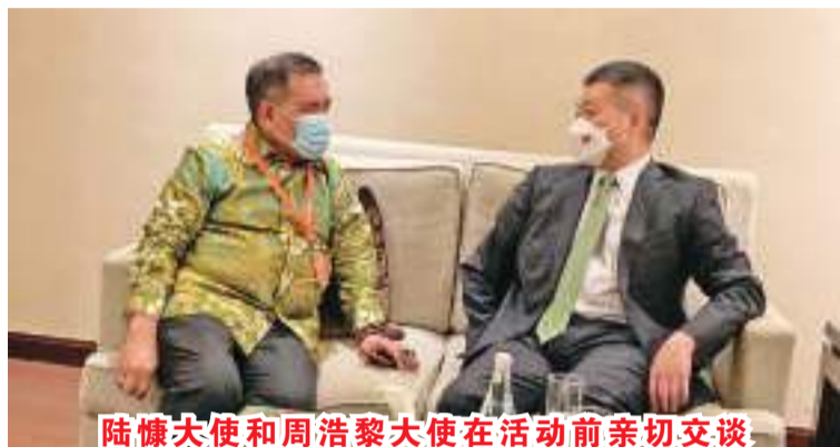
陆慷大使和周浩黎大使在活动前亲切交谈