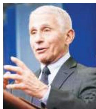
资料图:美国国家过敏症与传染病研究所所长福奇。

“我会让其他人来判断我的工作是否有价值,”福奇继续说道,“我希望人们记住我所做的事情是,这些年来的一天,我都毫无保留地付出了一切。” 此外,福奇还说道:“因为我们国家严重分裂……当我看到许多美国人受分裂主义和意识形态影响,以各种与公共卫生无关的理由拒绝接种疫苗时,作为医生,这令我感到痛苦。” 福奇再次呼吁人们接种新冠疫苗和加强针,他说:“我不想看到任何人住院,我不想看到任何人死于新冠。无论你是极右翼共和党人还是极左翼民主党人,对我来说都没有任何差别。”