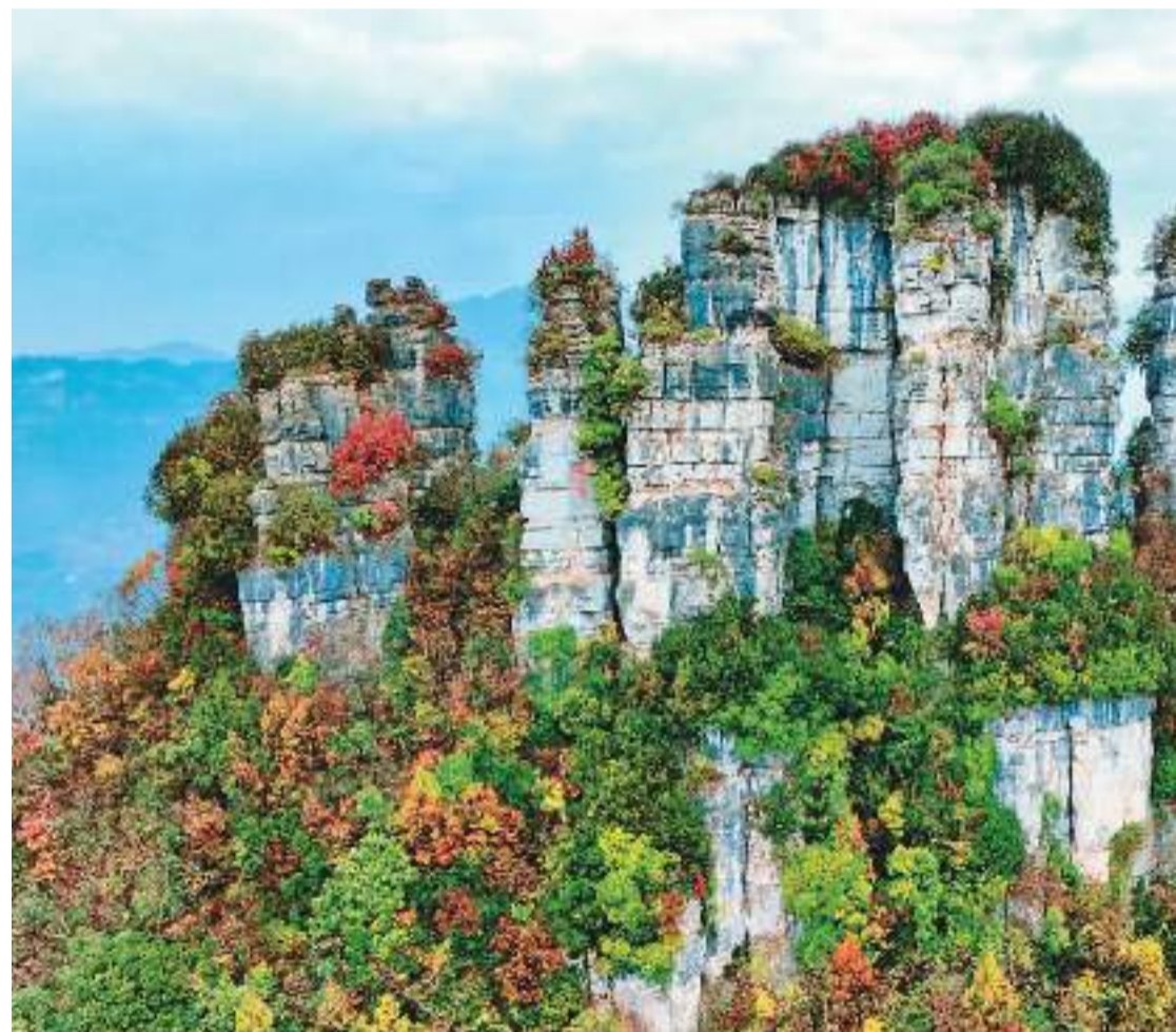
近年来,湖北省恩施土家族苗族自治州生态环境不断改善,优美的自然风光和丰厚的人文底蕴,吸引越来越多的人前来观光旅游。图为11月19日,恩施州恩施市新塘乡保水溪村,初冬时节的旗峰山山峦叠嶂,植被五彩斑斓,层林尽染,美不胜收。