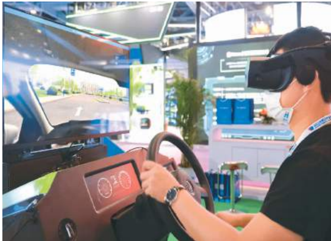
近日，2022世界VR产业暨元宇宙博览会暨VR产业大会在江西省南昌市开幕。图为观众在该博览会上体验虚拟驾驶。

中国电子技术标准化研究院高级工程师董桂官说，虚拟现实产业链条长，主要涵盖内容采集、制造、终端