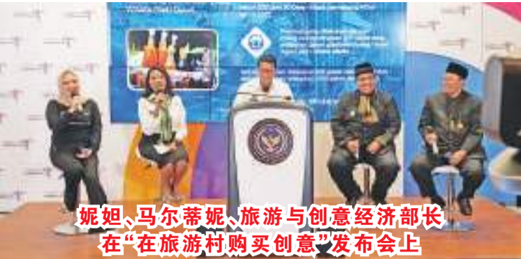
妮姐、马尔蒂妮、旅游与创意经济部长在“在旅游村购买创意”发布会上