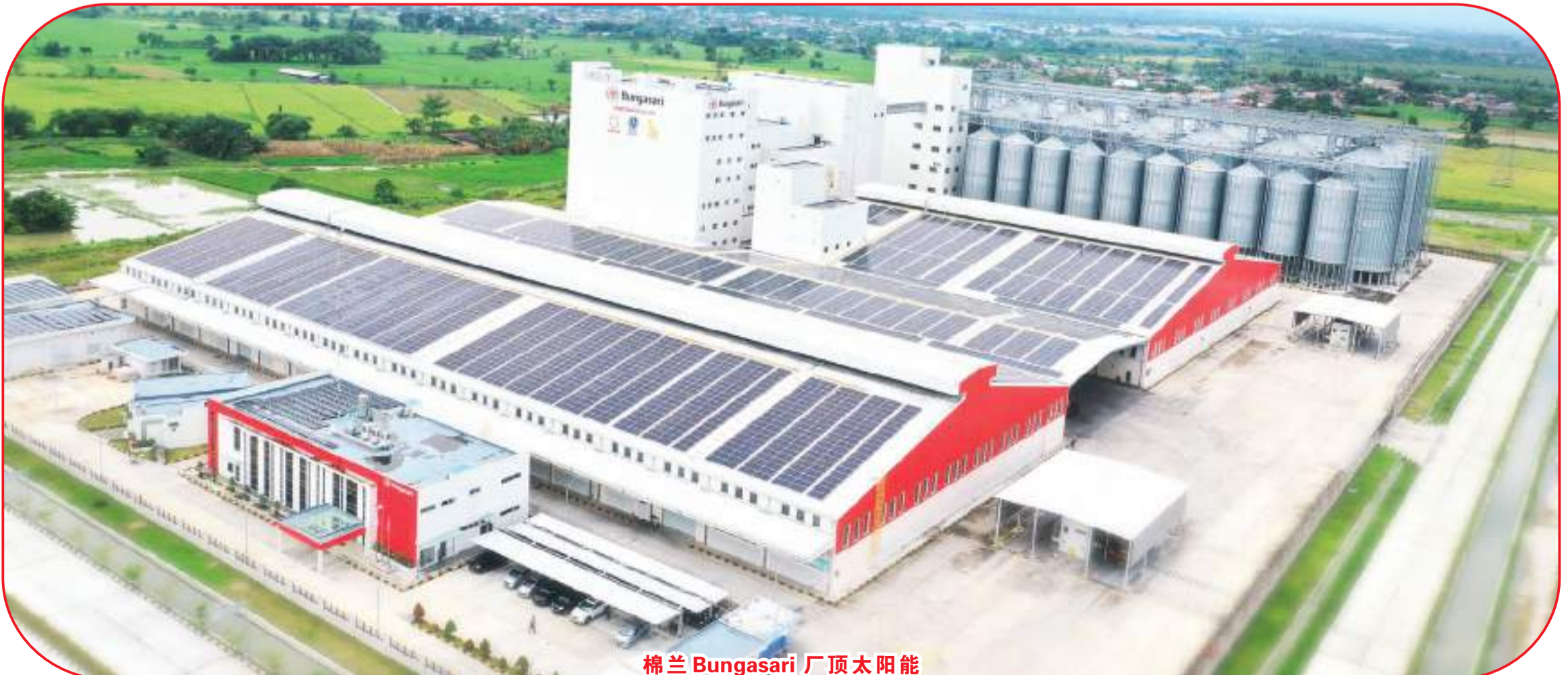
棉兰 Bungasari 厂顶太阳能