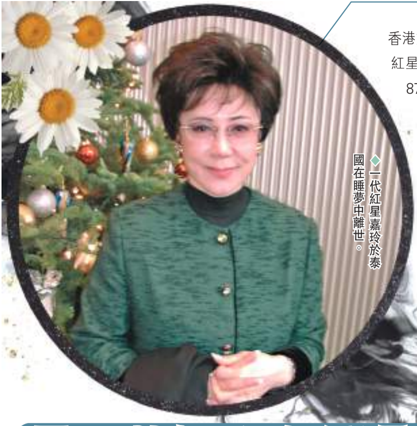
◆一代紅星嘉玲於泰國在睡夢中離世。

香港文匯報訊(記者阿祖、林子棠)一代粵語片紅星嘉玲21日於泰國家中在睡夢中離世,享年87歲,契女郭秀雲於當日凌晨接獲噩耗,她透露嘉玲患慢性肺疾一段時間,長時間在家臥床,如今去世是一種解脫,但身邊人就當然不捨,她表示非常難過並將盡快趕到泰國慰問契爺及送別契媽最後一程。令人意外的是資深演員黃栢文爆出原來是嘉玲的兒子。他已第一時間飛到泰國,透露嘉玲遺體於本週六(26日)進行火化。嘉玲是粵語片影星,與謝賢、胡楓同期,紅極一時,嘉玲與謝賢不單是銀幕拍檔,私底下更是情侶,謝賢更曾對外公開承認「第一個深愛的女人」是嘉玲。