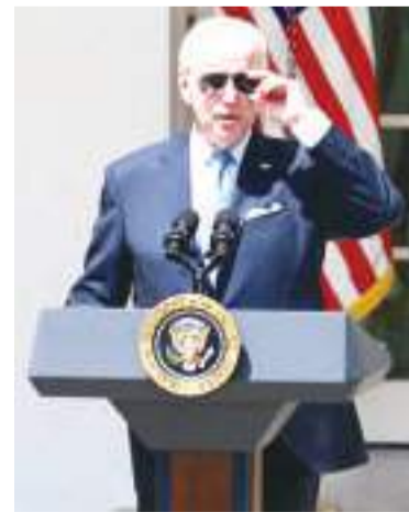
资料图:美国总统拜登。

“我当然不会详细说明该对话可能是什么样子。很明显,这是总统的特权,他有权和家人进行对话以做出决定,”她继续补充道。 据此前报道,11月早些时候,拜登表示计划参加2024年总统选举,且将与妻子吉尔在假期期间讨论是否应该参选,并预计于2023年年初做出决定。但美国有线电视新闻网(CNN)称,拜登80岁生日这一独特的里程碑到来之际,他正面临着有关他是否会竞选连任的猜测,以及他是否太老无法连任的