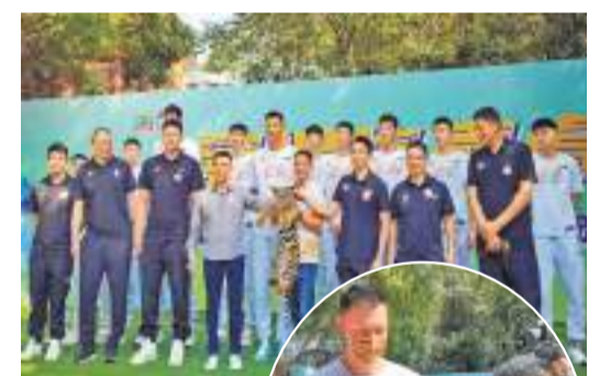
▲認養儀式現場。 ►易建聯與華南虎親密互動。

【香港商報訊】記者李芳報導：「華南虎」遇見華南虎。籃球場上的「華南虎」——廣東宏遠籃球俱樂部一眾隊員日前來到粵北韶關華南虎繁育研究基地，與華南虎幼崽進行了一次「虎虎生威」的親密接觸和愛心傳遞。