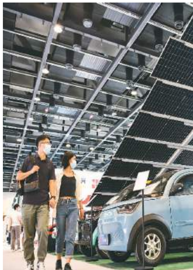
九月三日，在二〇二二年中国国际服务贸易交易会上，观众参观太阳能车。