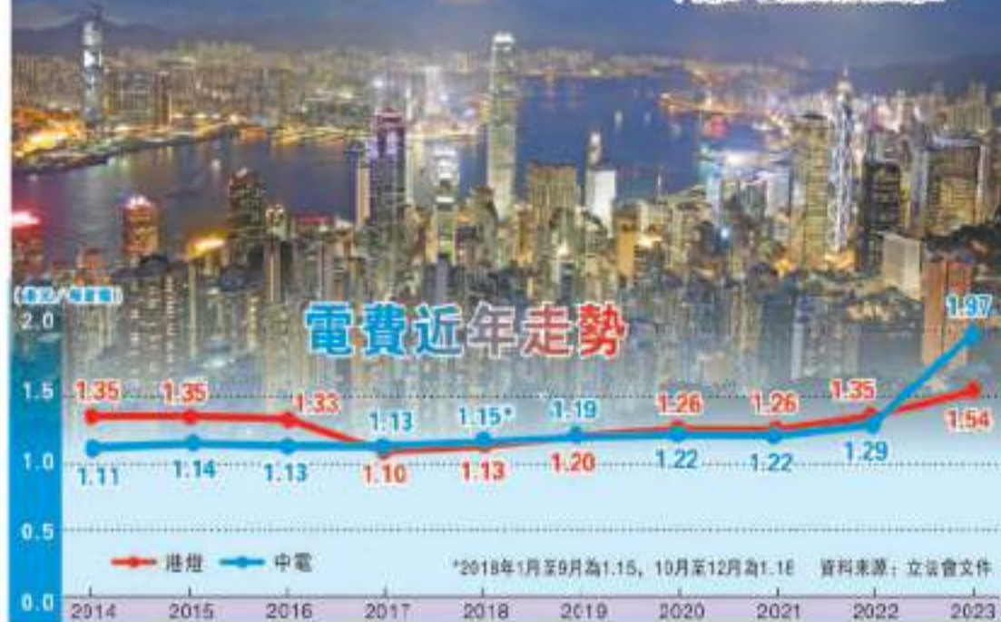
兩電來年加電費，中電加百分之六點四，港燈加百分之五點五。