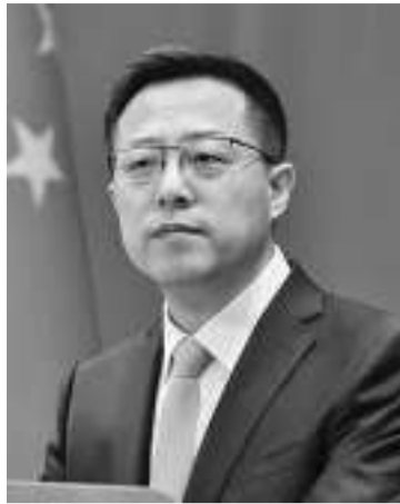
外交部发言人赵立坚

领导人集体会晤，开启了中国同太平洋岛国关系新篇章。面对求稳定、谋合作、促发展的共同愿望，中方希望通过执法能力与警务合作部级对话，同岛国建立更友好的合作关系、形成更高效的合作方式，提升更专业的执法能