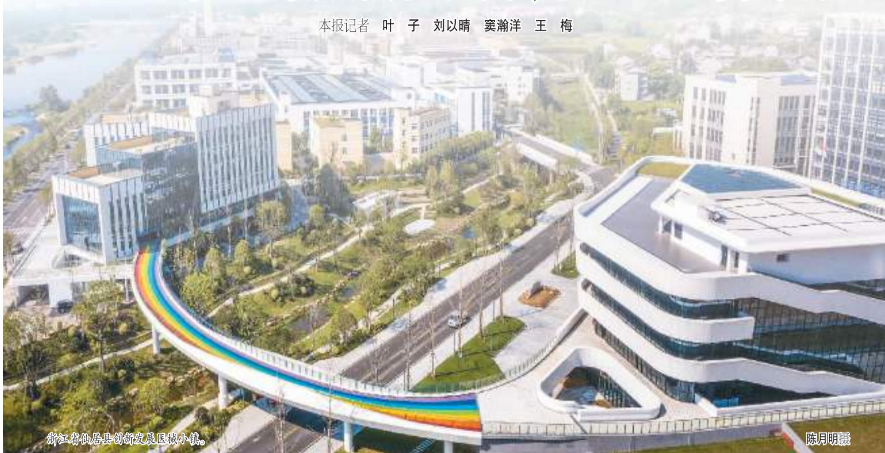
浙江省仙居县创新发展区医械小镇。