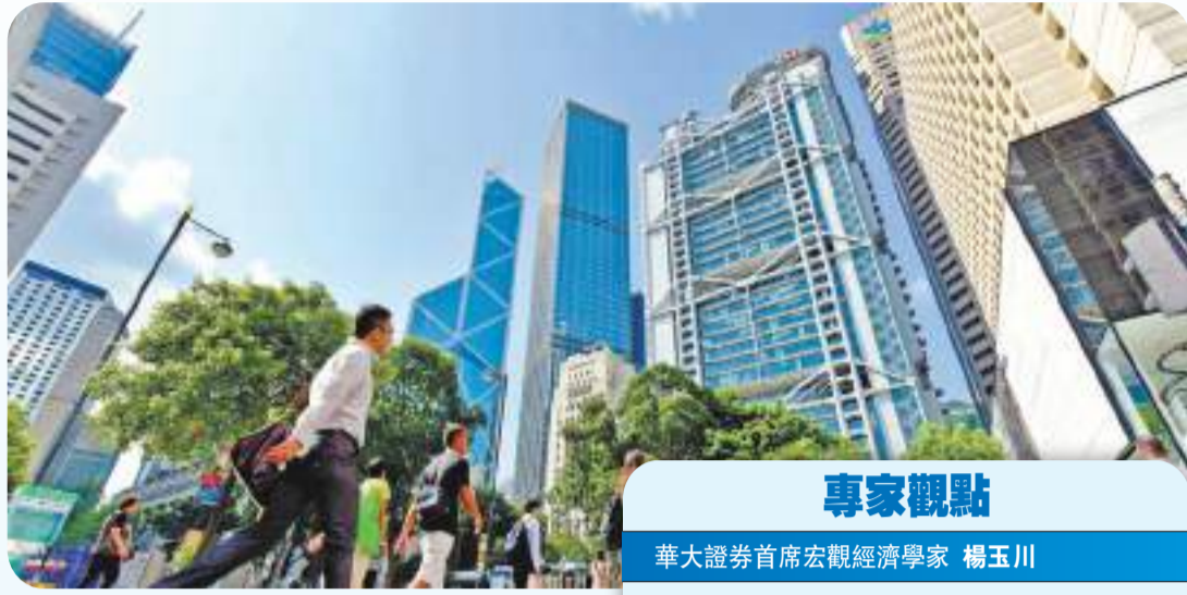
香港中環。

《深圳千里碧道建設羅湖實施方案》中明確提出：羅湖區碧道建設總體規劃以轄區「一主兩區三帶」的發展新格局為依託，構建「一帶兩廊三珠」的羅湖碧道主幹網絡。「一帶」是以蓮塘河串聯深圳河幹流（羅湖段）的深港共享經濟帶；「兩廊」是貫穿高密度建成區的布吉河及其支流（含筆架山河、清水河等）打造的歷史文化與現代科技交錯的人文廊道，以