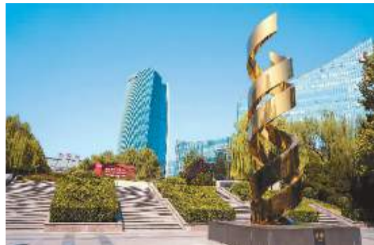
北京市海淀区中关村广场。