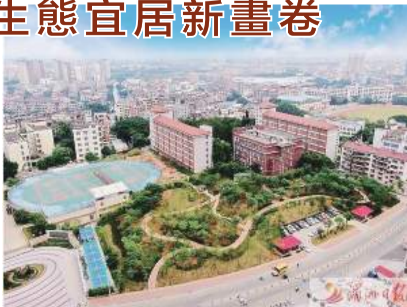
位於涵江城區的青璜口袋公園,為轄區居民提供了風景優美的活動場地。

全市首個海綿城市理念啤酒特色主題公園、全市首批智慧體育公園等一批高品質園林綠化項目建成投用,建設囊山森林公園、白塘湖公園、西河公園、城涵河道等11個城市綜合性公園,成為涵江一張張響亮名片。這些公園的建設,提升城市功能和品位,改善城市環境,為居民提供更加生態、親水、宜人的休閒娛樂場所。