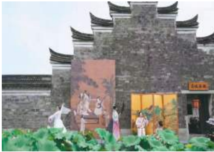
“文化润富 浙里最宋韵”活动现场。