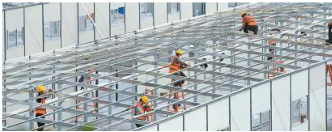
昨日，重慶寸灘方艙醫院施工現場一片忙碌，工人們正在進行活動板房的安裝。據悉，重慶寸灘方艙醫院建成投用後可提供16750張床位。

置，準確劃分風險區域，有序組織核酸檢測，有效管控風險人群，嚴格規範隔離工作，確保屬地、部門、單位、個人「四方責任」落實到位，盡快遏制疫情擴散蔓延。要持續整治層層加碼，該管住的要堅決管住，該取消的要堅決取消，該落實的要落實到位，保障好疫情處置期間民衆的基本生活和就醫需求。