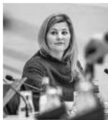
荷兰外贸与发展合作大臣施赖纳马赫尔

【环球网报道】“美国呼吁禁止向中国出售更多芯片设备，荷兰抵制。”美国彭博社22日以此为题报道称，荷兰外贸与发展合作大臣施赖纳马赫尔当天表示，在向中国出售芯片设备的问题上，荷兰将捍卫本国的经济利益。报道说，荷兰高级官员的这一表态再度表明，荷兰不愿从华盛顿切断中国半导体技术供应的企图。