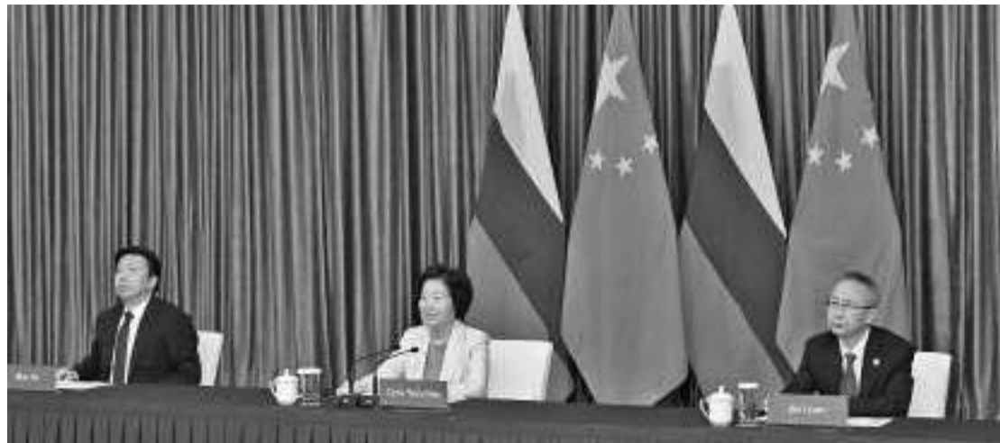
11月22日，中俄人文合作委员会第二十三次会议通过视频连线方式召开，国务院副总理孙春兰与俄罗斯副总理戈利科娃共同出席。