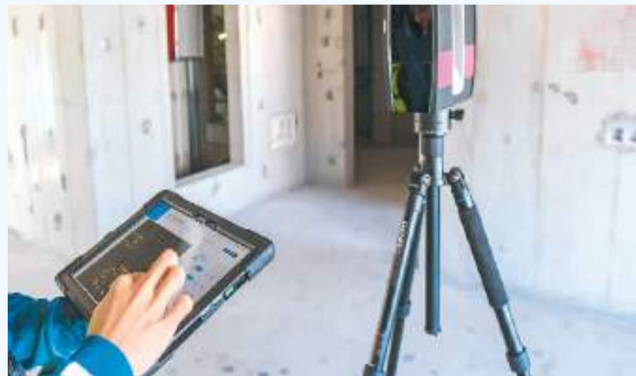
在广东顺德的在建住宅项目凤桐花园，施工人员用平板电脑操控测量机器人对施工房间进行测量。

近日，住房和城乡建设部公布智能建造试点城市，北京等24个试点城市将积极探索建筑业转型发展的新路径。清华大学土木工程系教授马智亮接受本报采访时说：“通过推广智能建造，传统建筑业将迎来转型升级，不仅可以推动行业的技术进步，还可以提升工程质量安全、效益和品质，有效拉动内需，培育国民经济的新增长点。”