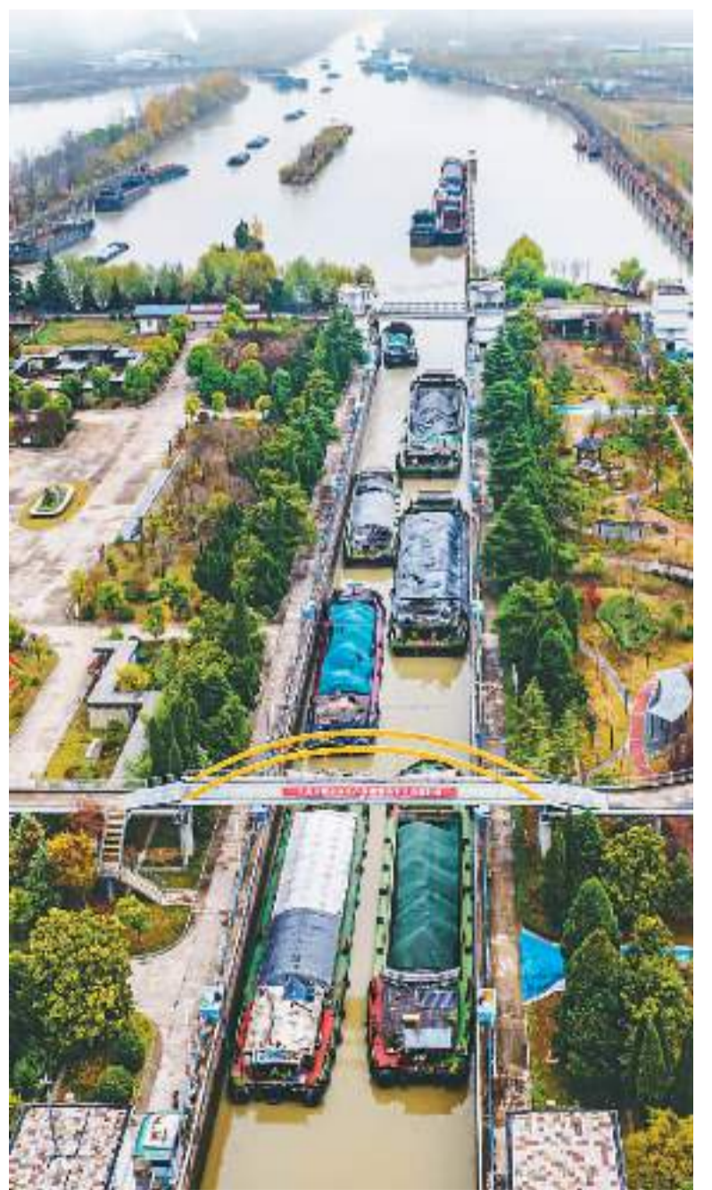
大运河,沟通南北,贯通古今,是世界上开凿最早、规模最大、里程最长的人工河。近年来,在新发展理念指引下,大运河保护、传承、利用开启新篇章。图为11月20日,京杭大运河江苏宿迁段的货船穿梭往来,一派繁忙景象。