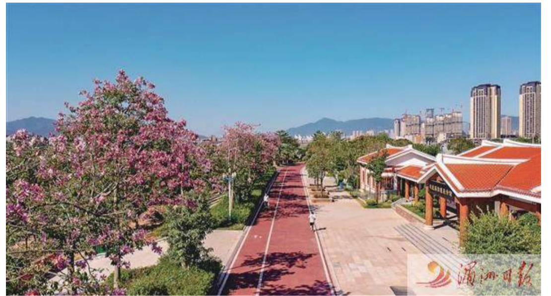
木蘭溪慢道旁異木棉花盛開,市民在慢道上休閒鍛煉。