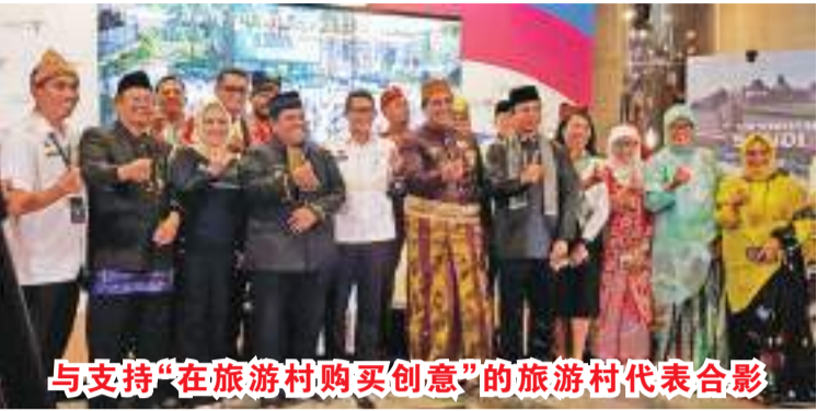
与支持“在旅游村购买创意”的旅游村代表合影

【本报讯】旅游和创意经济部/旅游和创意经济局出台了“在旅游村购买创意”(Beti Dewi)方案,推广