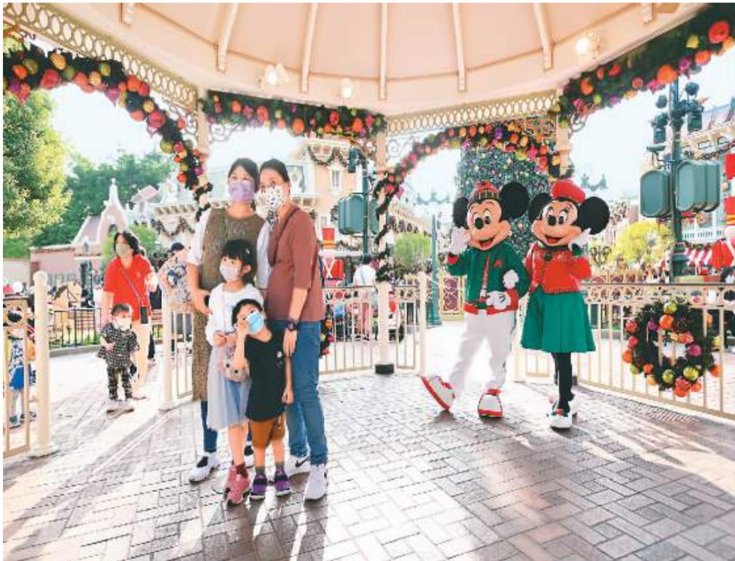
香港迪士尼乐园度假区近日举办圣诞活动，丰富多彩的活动和颇具特色的装饰吸引着市民们前往参观游览。图为宾客与穿上圣诞服饰的米老鼠角色合照。

“沪港慈善健步行”由沪港青年会主办，上海市人民政府港澳事务办公室、上海海外联谊会、上海市青年联合会、上海市政协港澳台侨委员会等指导。