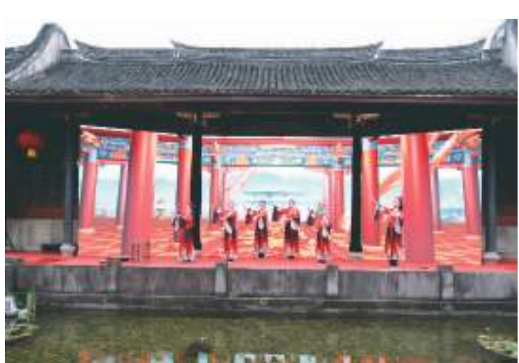
身着汉服的少年儿童朗诵古诗。

宁波正以开放的姿态在国际上大放异彩，宁波举办的文化活动不再是简单的“集散地”，而是真正的“孵化器”；不再是简单“中国风格”的形式展现，更催生出自信包容、主体鲜明、与时俱进的“中国概念”，让世界更好地感知中华优秀传统文化。