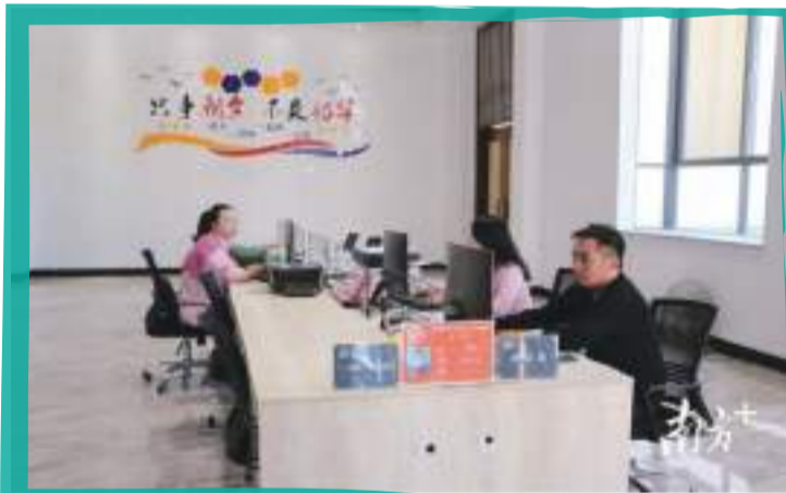
大埔縣鄉村振興人才驛站配有專職工作人員負責人才工作。

真心服務真到位，人才自然願意來。借助鄉村振興人才驛站這一平臺，目前大埔已舉辦技能培訓、人才沙龍、項目洽談、網絡招聘等活動32場次，進場企業76家，達成就業意向2000多人。同時，積極扶持青年人才回鄉創業，推動當地涉農金融機構在驛站定期開展金融服務，已為210名優秀人才提供創業擔保貸款利息補貼，發放創業擔保貸款1000多萬元。