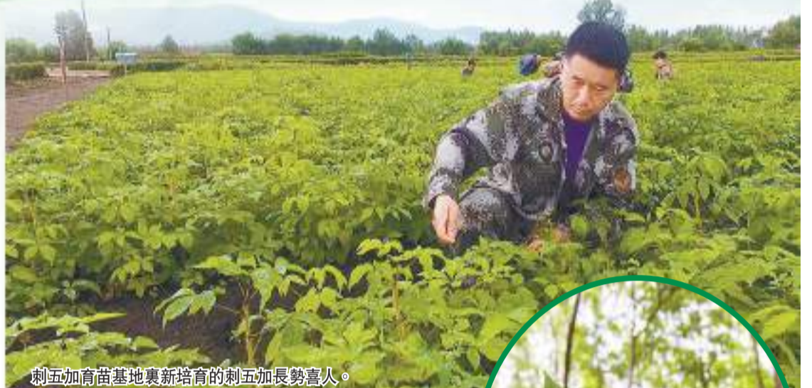
刺五加育苗基地裏新培育的刺五加長勢喜人。

業局有限公司建成了500畝育苗基地，分別爲紅一林場135畝、陳家亮子林場50畝、星火林場170畝、萬寶山林場145畝。每年可育苗2000萬株，能夠實現栽植苗木自給自足。