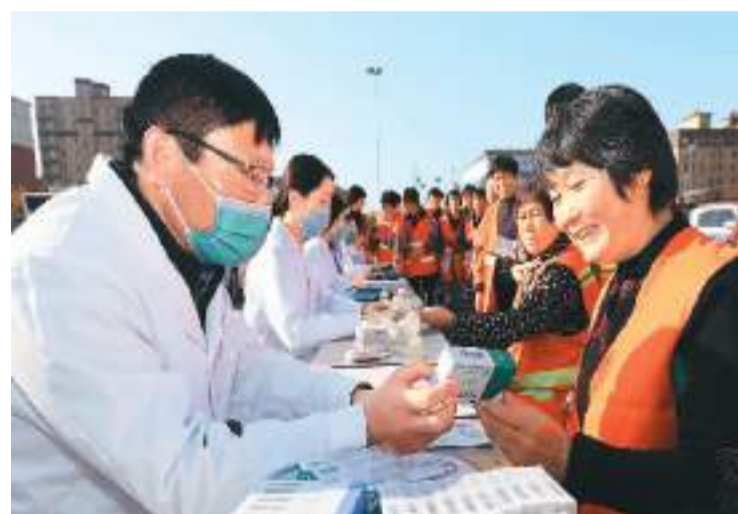
近日,江苏省连云港市赣榆区柘汪镇面向当地环卫工人开展免费健康体检活动。

徐爱民介绍,随着影像学手段和检查技术的进步,发现结节变得越来越容易。当前,体检中检出率较高、较为常见的结节有肺结节、乳腺结节和甲状腺结节。