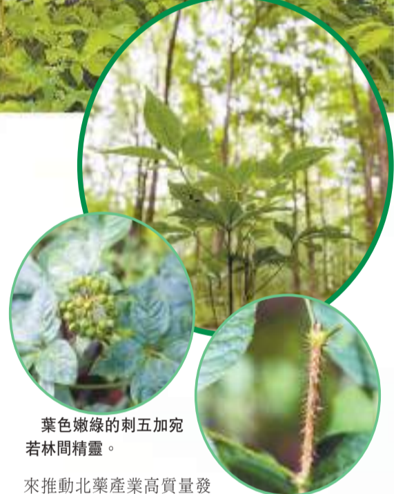
葉色嫩綠的刺五加宛若林間精靈。

來推動北藥產業高質量發展？針對記者的提問，趙桂安侃侃而談，從三個方面向記者展開介紹。