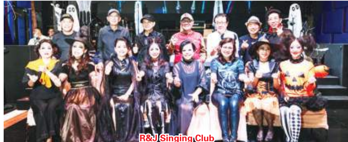
R&J Singing Club

【本报讯】2022年10月31日(星期一),雅加达Rock & Jazz (R&J) Singing Club 由乐队伴奏,在雅加达太阳城国际酒楼举行庆祝万圣节(Halloween)联欢晚会。