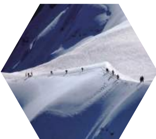
新華社北京11月3日電——聯合國教育科學文化組織3日發布報告稱，由於全球變暖，位

於世界遺產區的一些知名冰川可能會在2050年前消融殆盡，包括意大利多洛米蒂山區、美國黃石和約塞米蒂國家公園、坦桑尼亞乞力馬扎羅山的冰川。