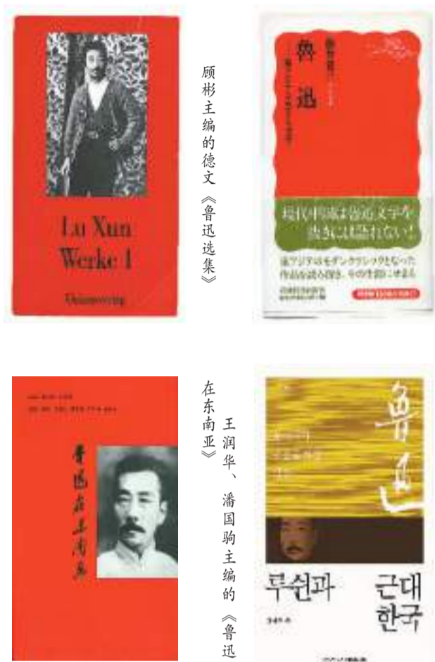
顾彬主编的德文《鲁迅选集》