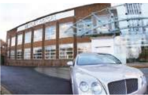
參考消息網11月3日報道——據英國《泰晤