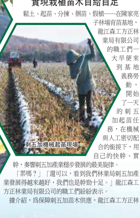
刺五加機械起苗現場。