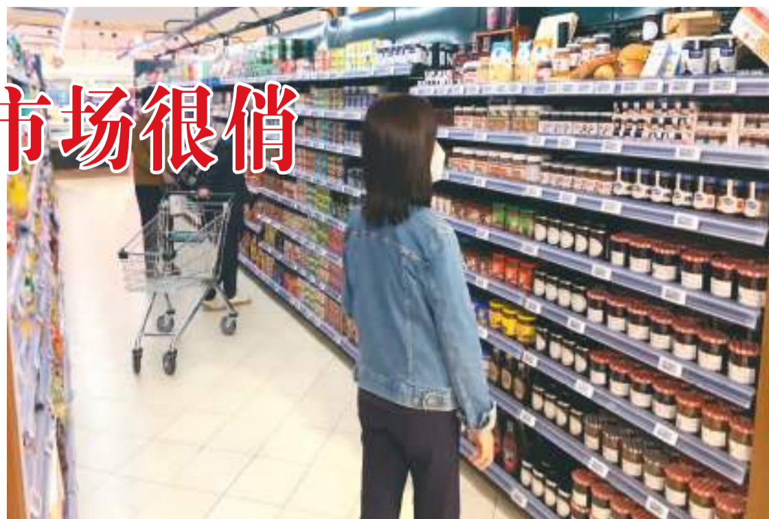
消费者在北京市朝阳区一家超市选购罐头食品。