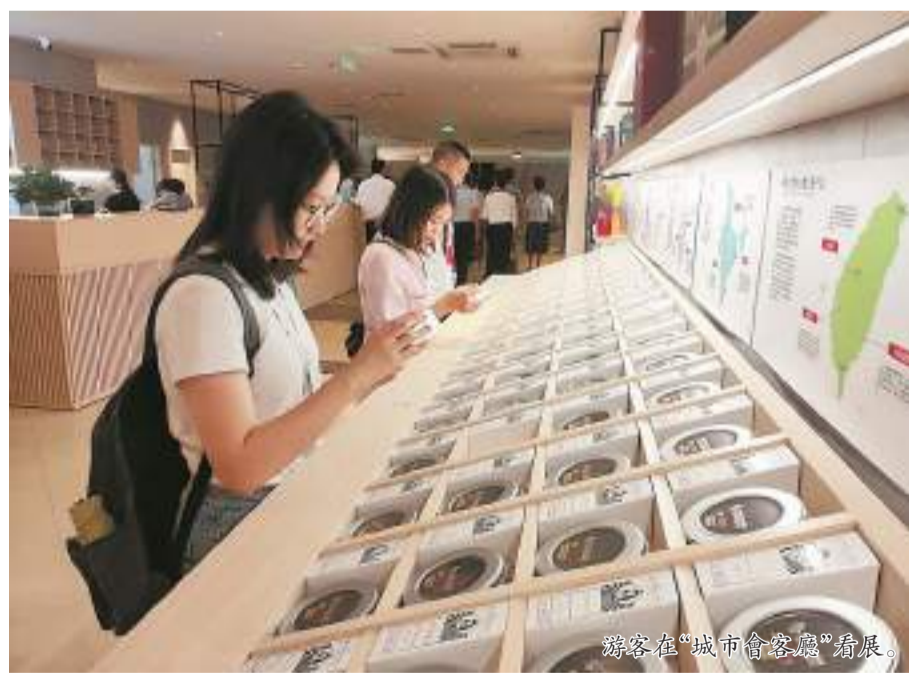
遊客在“城市會客廳”看展。