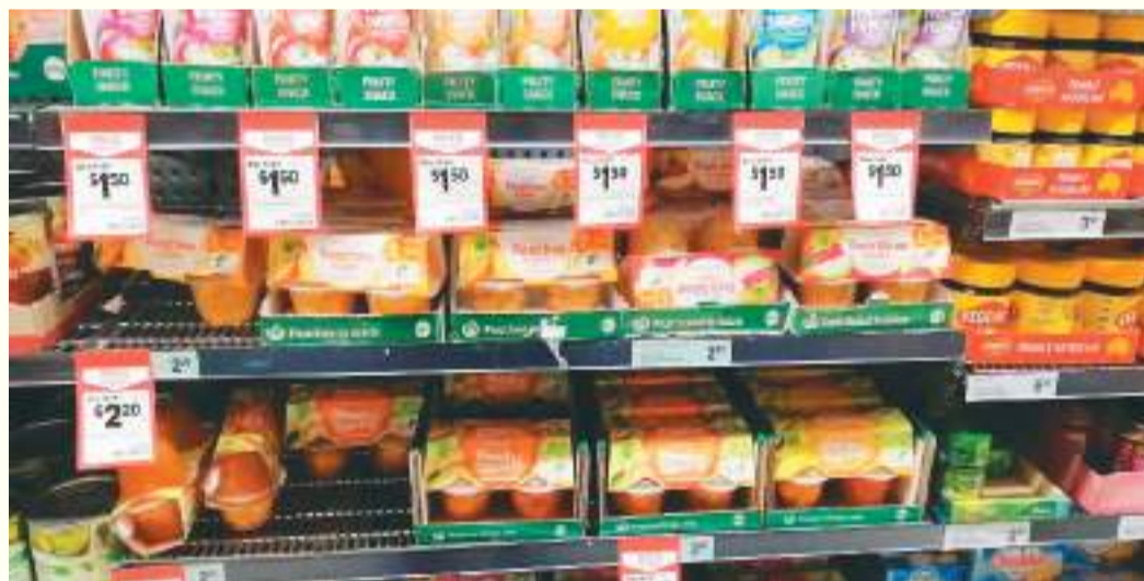
▼在澳大利亚悉尼一家超市，青岛开创食品公司的罐头产品被摆在显著位置。