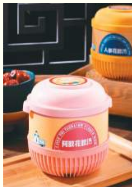
▲广州鹰金钱研发的自热汤罐头。