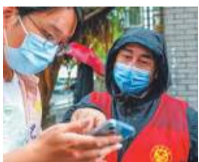
10月31日上午,阿拉丁在温泉路一小区门口当志愿者查验健康码。