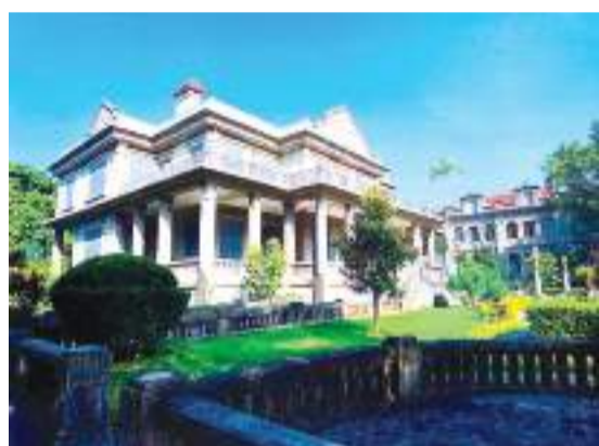
鼓浪嶼黃家花園中樓、北樓及花園一角。

20 世紀二三十年代，廈門的人每天的生活幾乎都與一個人有關：從喝水到用電，從打電話到買東西，從逛馬路到乘車或坐船進出島，乃至就醫、求學、住房等方面。不僅如此，廈門能成為福建省第一個建市的城市，也與他有關。僑批、鼓浪嶼和泉州的成功申報世界記憶名錄、世界文化遺產名錄，他也功不可沒。