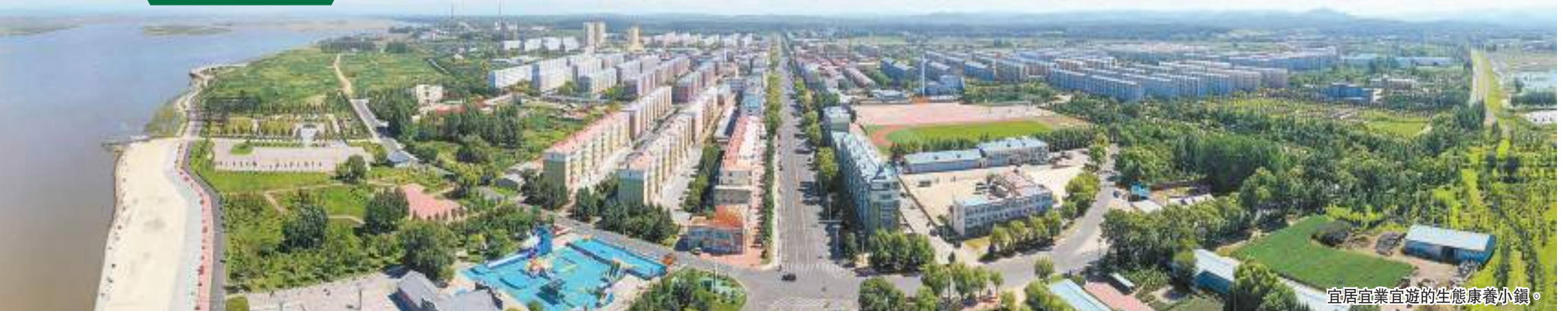
宜居宜業宜遊的生態康養小鎮。