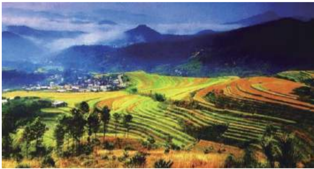
大埔游打卡點坪山梯田

十月的大埔，色彩斑斕，黃色的柚子、綠色的百香果、青色的陶瓷……組成了一幅產業興旺的鄉村振興畫卷。