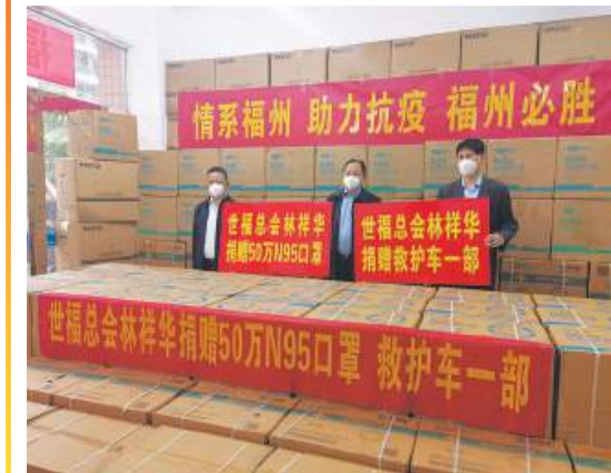
抗疫物资捐赠现场。