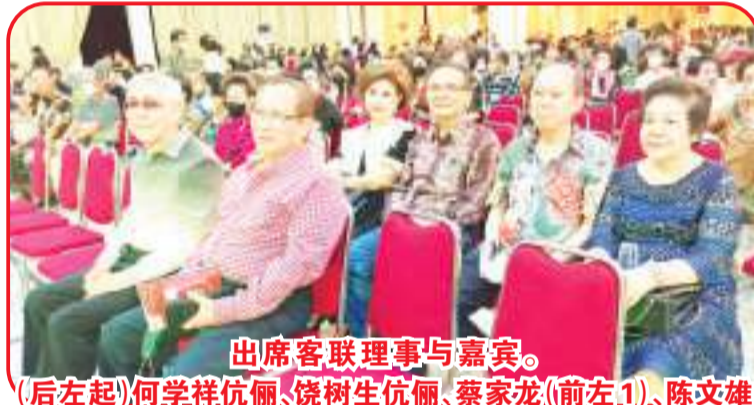
出席客联理事与嘉宾。