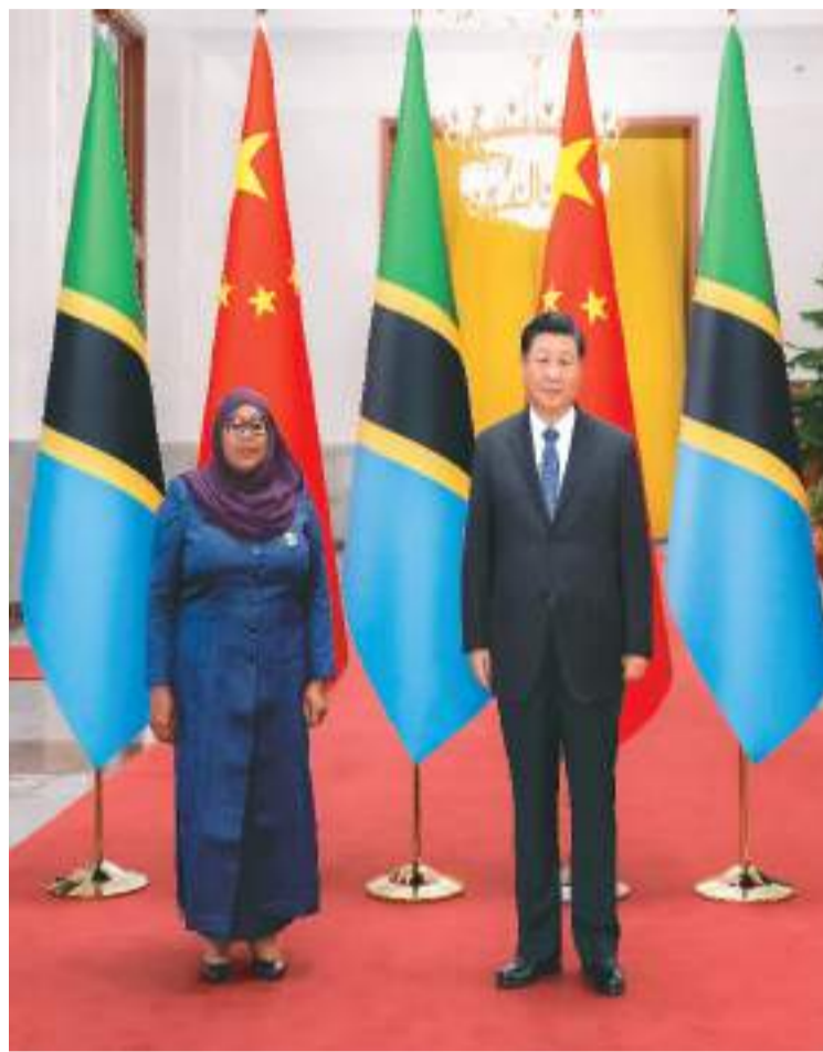
十一月三日, 国家主席习近平在北京人民大会堂同来华进行国事访问的坦桑尼亚总统哈桑举行会谈。这是会谈前, 习近平在人民大会堂北大厅为哈桑举行欢迎仪式。

新华社北京11月3日电 国家主席习近平11月3日下午在人民大会堂同来华进行国事访问的坦桑尼亚总统哈桑举行会谈。两国元首宣布, 将中坦关系提升为全面战略合作伙伴关系。