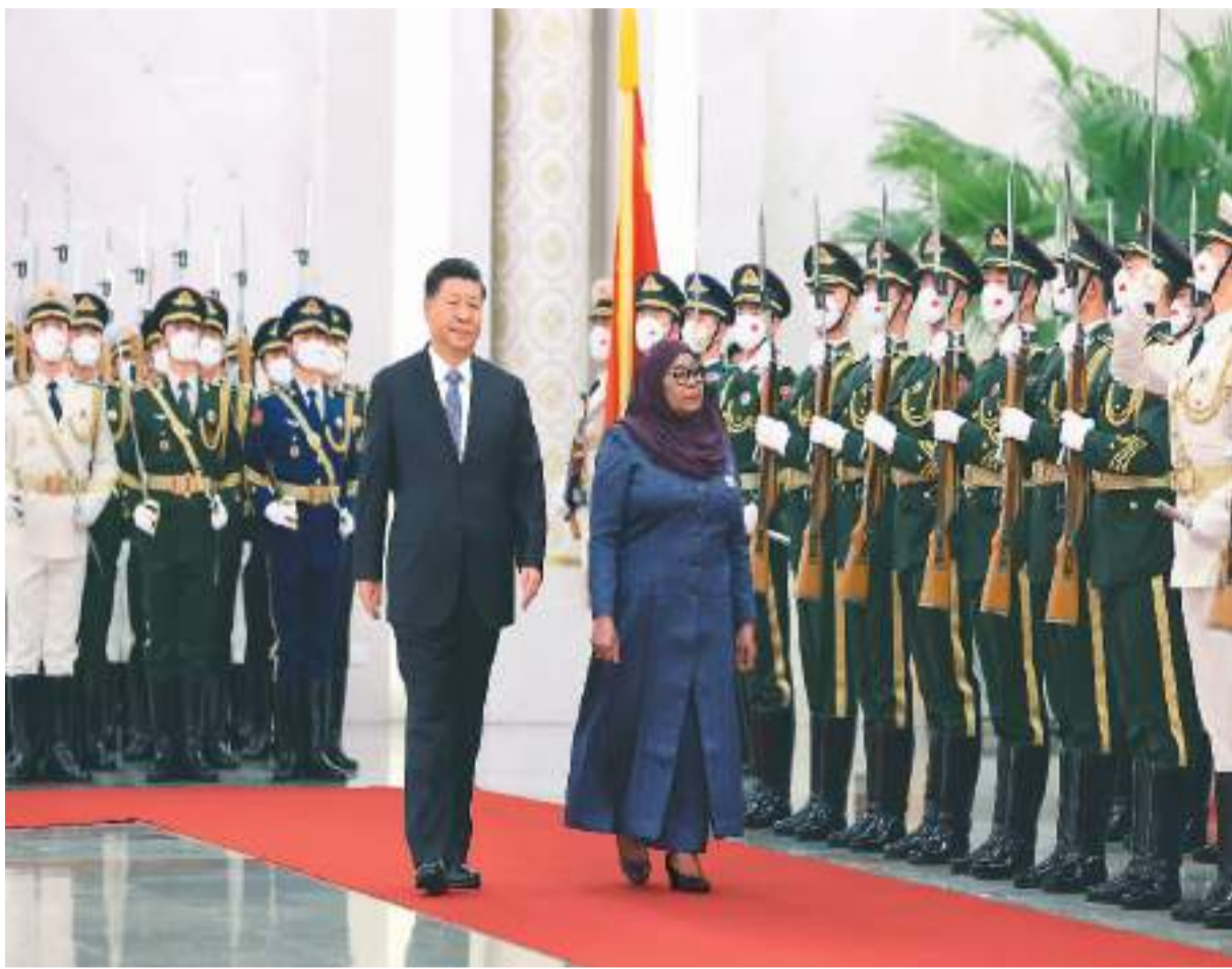
十一月三日, 国家主席习近平在北京人民大会堂同来华进行国事访问的坦桑尼亚总统哈桑举行会谈。这是会谈前, 习近平在人民大会堂北大厅为哈桑举行欢迎仪式。