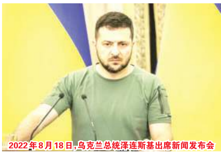
2022年8月18日，乌克兰总统泽连斯基出席新闻发布会

表示，2019年以来，美国将对古巴的围困升级到极端程度，拜登政府虽然采取了一些“积极行动”，但仍在继续特朗普时期的“最大压力”政策。1959年古巴革命胜利后，美国政府一直对古巴采取敌视态度。1961年，美古断绝外交关系，次年，美国宣布对古巴实施经济、金融封锁和贸易禁运。1996年3月，美国制定“赫尔姆斯-伯顿法”，规定对所有同古巴发生经济贸易往来的外国公司实施严厉制裁。2015年7月，美古两国正式恢复外交关系，美国政府采取措施减少对两国间在商业、人员往来方面的限制。特朗普就任美国总统后，美国政府再次收紧对古巴政策。自1992年起，联大每年都对古巴提交的关于终止美国对其封锁的决议草案进行表决，唯一例外是2020年受新冠疫情影响这一问题的讨论被推迟到次年。时至今日，相关决议已连续30次以压倒性多数获得通过。