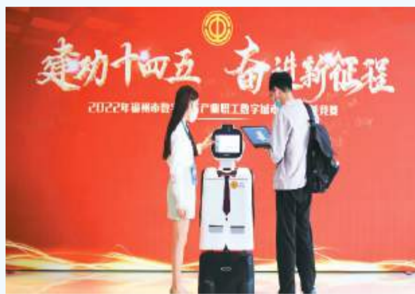
在福建省福州市数字经济产业职工数字城市应用技能竞赛决赛现场，工程师对巡检防疫版机器人进行检测。

在日前举行的第二届福建省机器人焊接技能大赛现场，参赛选手全神贯注地完善软件编程、设置参数、设计机器人运动轨迹、瞄准机