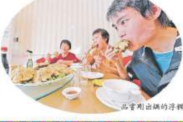
品嘗剛出鍋的浮標