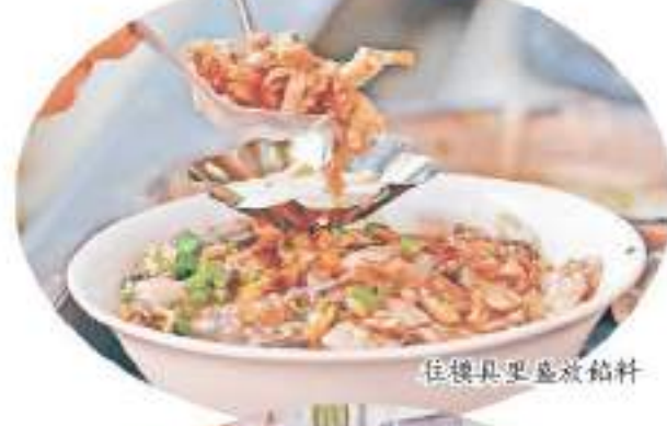
佐饌具更盛放餡料