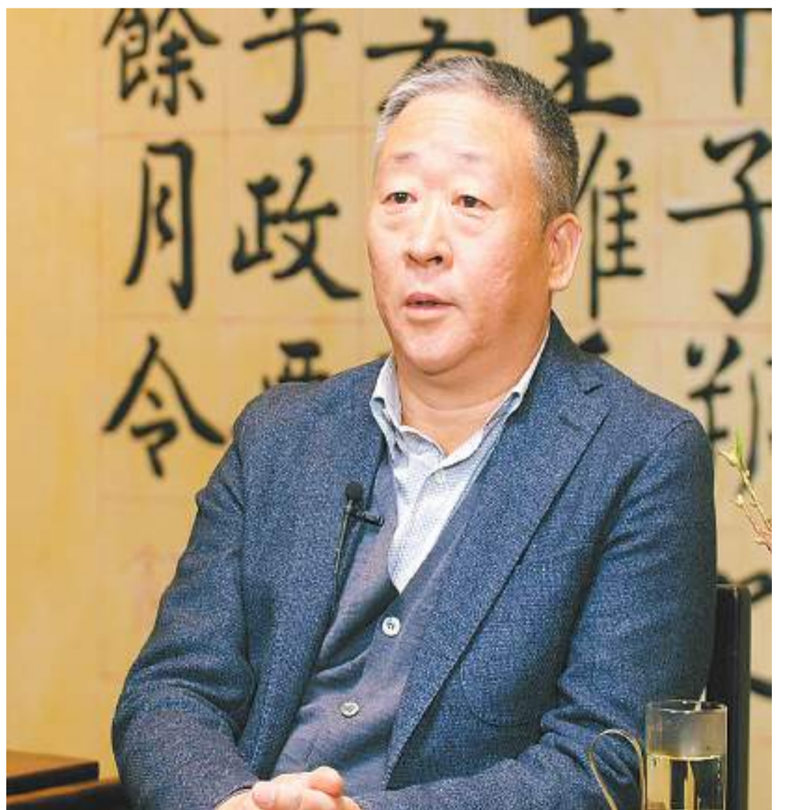
中國酒業協會理事長宋書玉先生接受本報專訪。

宋書玉表示，啤酒很早就實現了工業化，從科研、釀造、數字化生產和整個管理體系上來講，啤酒是走在整個食品工業前沿的。相信未來尤其是二十大後，我國啤酒工業在科技水平、智能化釀造等方面會有更為快速的發展。