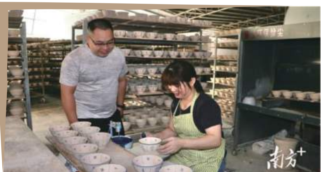
大埔陶瓷產業發展迎來越來越多的年輕面孔。