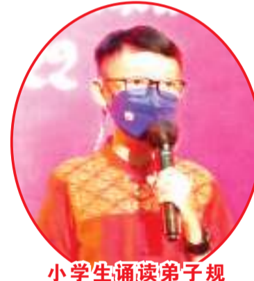
小学生诵读弟子规

【万隆讯】10月29日,万隆客属联谊会在会所二楼举办第40届银会联欢会。赴会者众,大家都很开心地享用各样美食和点心小吃,而后观赏由客联属下崇仁三语国民学校小学、初、高中学生表演的节目,以及万隆歌手们大展歌喉,演唱华语歌曲以娱嘉宾。