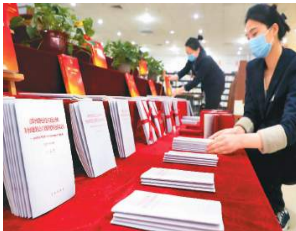
▲10月31日，安徽省六安市新华书店工作人员在整理新上架的《高举中国特色社会主义伟大旗帜 为全面建设社会主义现代化国家而团结奋斗》单行本，供市民选购。