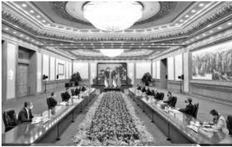
11月4日上午，中国国家主席习近平在北京人民大会堂会见来华正式访问的德国总理朔尔茨。

习近平强调，政治互信破坏很容易，重建却很难，需要双方共同呵护。我很欣赏德国前总理施密特的一个观点，“政治家应当以宁静接受那些不能改变的，以勇气改变那些能改变的，用智慧分清其中的区别”。中德应该相互尊重、照顾彼此核心利益，坚持对话协商，共同抵制阵营对抗、泛意识形态化等因素干扰。双方要始终从战略高度把握两国关系大方向，以建设