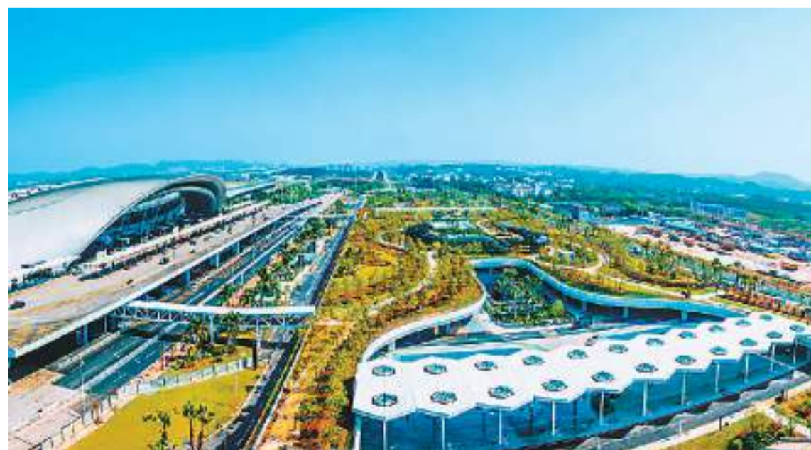
广西壮族自治区南宁国际空港综合交通枢纽工程日前正式竣工投运。该项目由中建八局南方公司承建，是广西首个集民航、高铁、地铁、城市公交及公路等功能于一体的特大型现代综合交通枢纽。项目建成后，崇左市与吴圩机场之间的路程将缩短至30分钟。图为南宁国际空港综合交通枢纽工程。

国家粮食和物资储备局相关负责人表示，秋粮上市以来，各类企业积极入市收购，市场购销较为活跃，收购进度快于上年。据各地反映，收购中优质优价特征明显，中晚稻优质品种价格比普通品种每斤普遍要高1角钱以上。