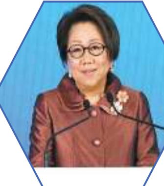
史美倫強調，世界各地需要加強聯繫。