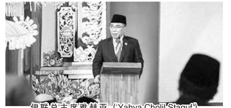
伊联总主席雅赫亚(Yahya Cholil Staquf)

【本报讯】伊联总主席雅赫亚(Yahya Cholil Staquf)于巴厘努沙杜瓦君悦酒店举行的20国集团宗教论坛(R20)上,在数百名代表面前表示,通过这项宗教论坛,希望世界各地的宗教领袖能够找到解决宗教之间冲突的方法,就像从过去到现在一直在发生的那样。