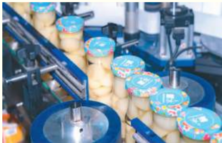
▲蒙水食品集团有限公司罐头生产车间一瞥。