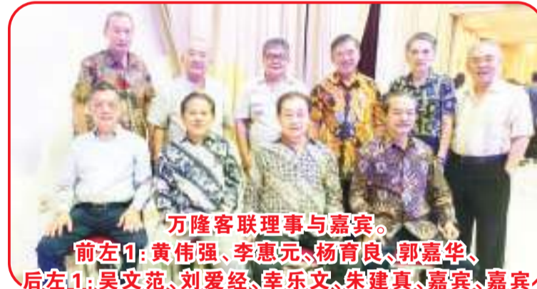
万隆客联理事与嘉宾。