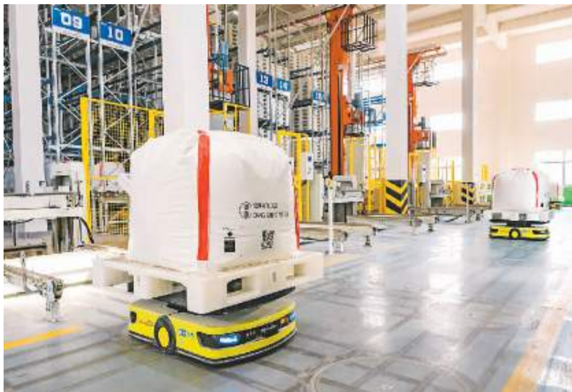
江西省新余市高新区通过支持企业利用现代数字信息技术、人工智能技术等对产业进行全方位、全链条改造，促进锂电、光伏、智能制造等重点行业数字化转型。图为在高新区锂电新能源产业园赣锋锂电的车间内，AGV转运机器人在智能程序下执行打托备货工序。

专家认为，应用需求是技术进步的重要推动力，挖掘开拓应用场景，加速新技术落地，有助于保持中国人工智能发展的优势。此次遴选的人工智能典型应用场景，对促进人工智能技术产品落地产生了较强推进作