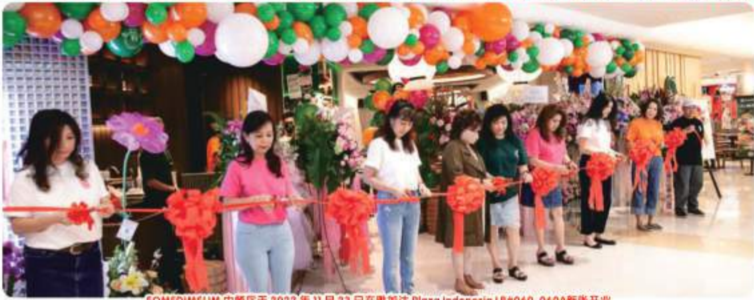
SOMEDIMSUM 中餐厅于 2022 年 11 月 23 日在雅加达 Plaza Indonesia LB#060, 060A 新张开业

点心在普通话中意为“触动心灵”，是由几种小吃组成的美味菜肴，包括油炸的、或清蒸的。有些清蒸的点心会装在竹制容器中蒸制，目的是在食用时保持温软、清香、松绵的