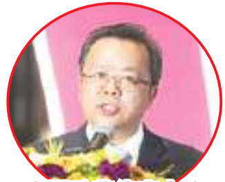
中国驻菲律宾大使 黄溪连致词