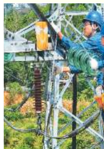
安徽省安庆市怀宁县供电公司切实保障民生、公共服务和重要用户用电，因地制宜加强城乡电网建设，助力新型城镇化和乡村振兴。图为近日该公司工作人员在怀宁县三桥镇检修变电站，提升乡村供电保障水平，备战迎峰度冬。