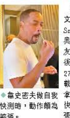
韋史密夫做自我快測時,動作頗為誇張。

他大喊:「我有病毒啦!」 據悉,原本要出席新片《解我枷鎖》(Emancipation)謝票活動的他,因染疫而未能現身,但他改為坐於電腦前以視像形式與影迷見面,而他的病況亦不嚴重,有網民留言讚賞韋史密夫負責任的態度,祝他早日康復!