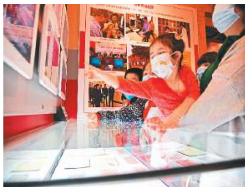
福建泉州侨批馆是首个“福建侨批展示基地”，位于著名泉州籍旅菲华侨陈纯的故居。图为市民在泉州侨批馆内参观。