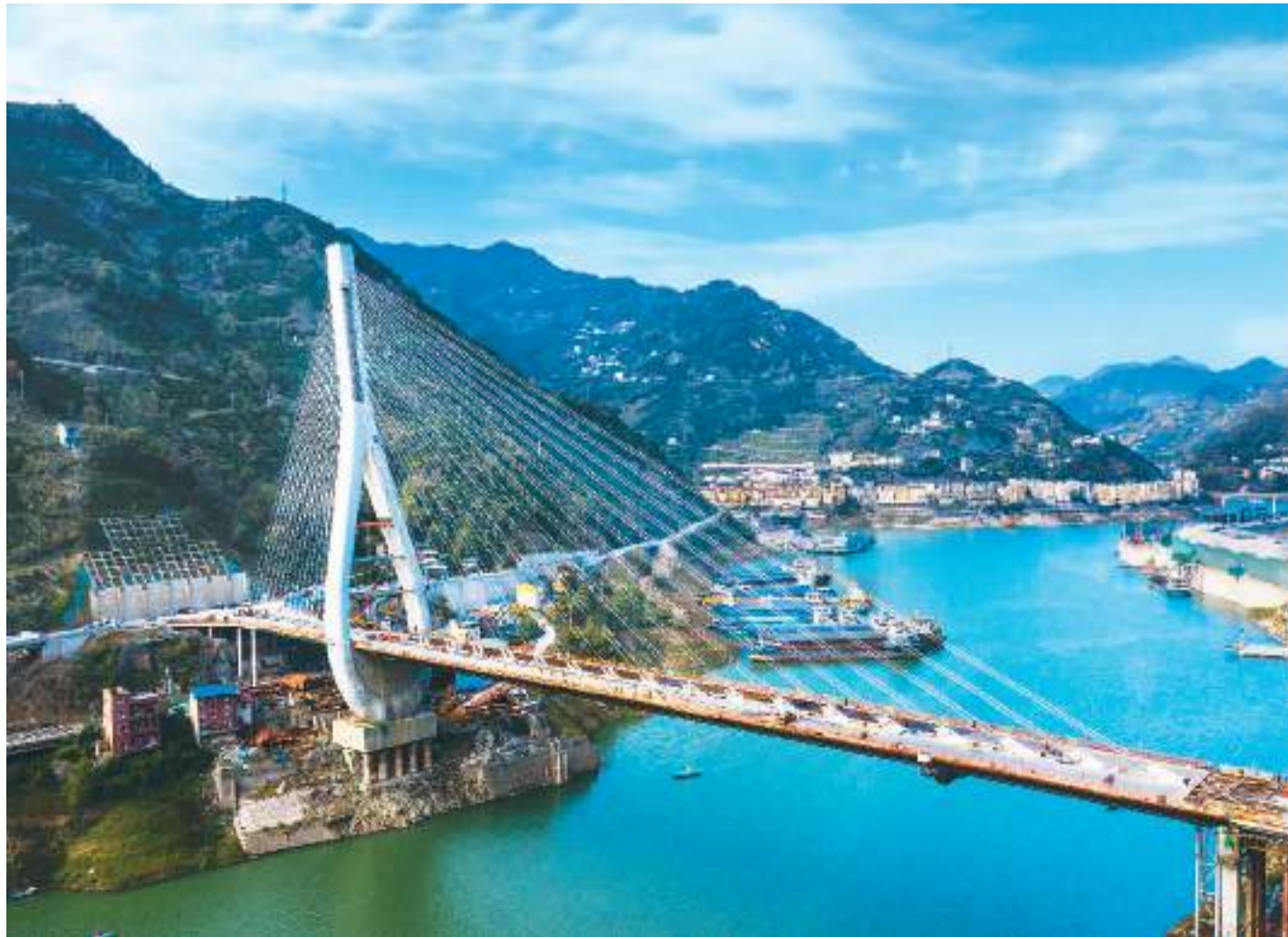
近日,湖北省宜昌市的香溪河大桥正在抓紧建设,琵琶形独塔斜拉桥的主体结构已经成形。香溪河大桥是连接宜昌市兴山县峡口镇和秭归县乐平里区域的重点交通枢纽工程,塔身采用顺桥向倾斜10度的琵琶造型。项目预计明年建成通车。图为建设中的香溪河大桥。

本报石家庄11月26日电(记者张志锋)26日上午9时25分,随着D6601次试验列车从北京站开出,京唐京滨城际铁路正式接入北京站,北京站至唐山站、北京站至北辰站开启全线运行试验阶段,今年年底前将正式“上线”运营,轨道上的京津冀出行更加便捷。