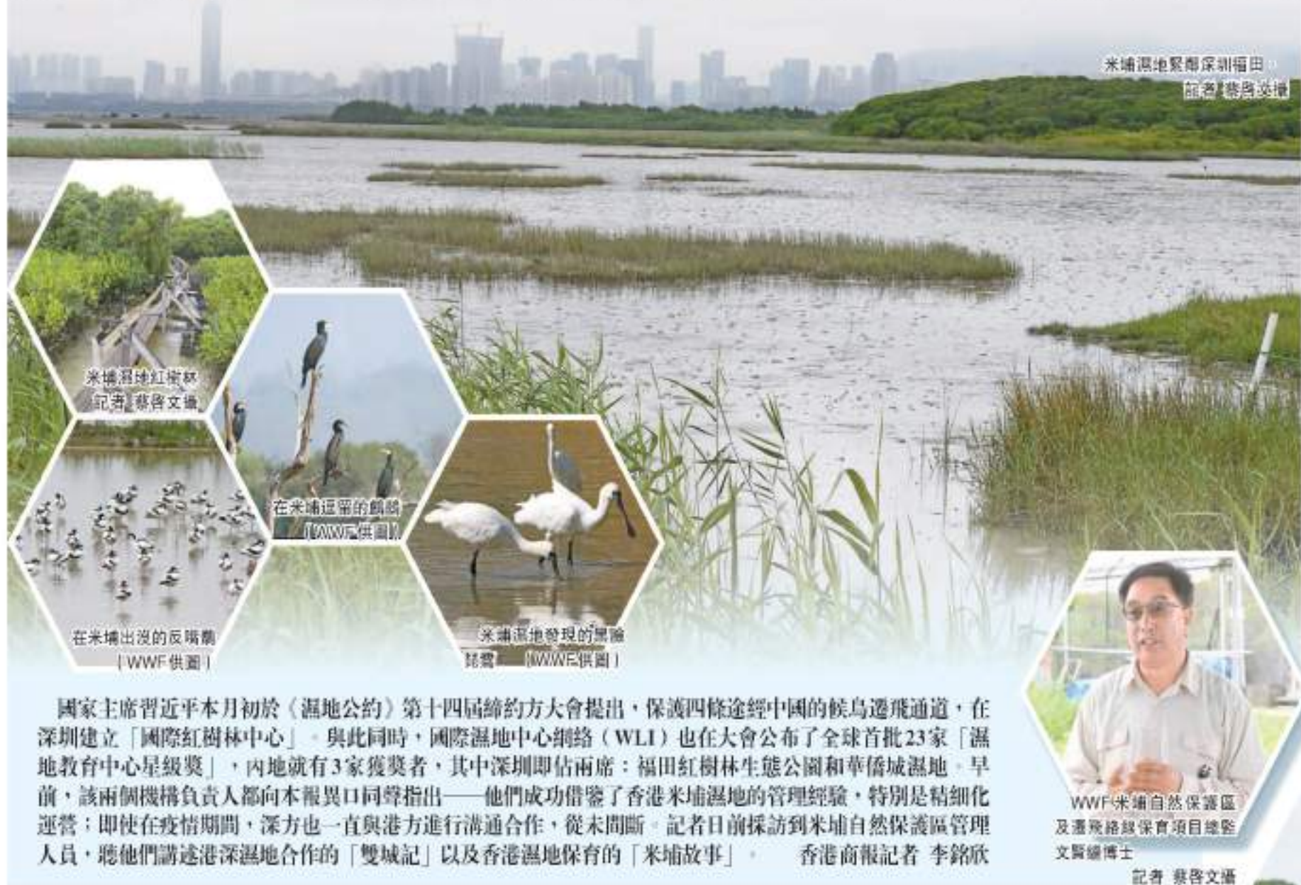
米埔濕地緊鄰深圳福田， 記者 蔡啟文攝