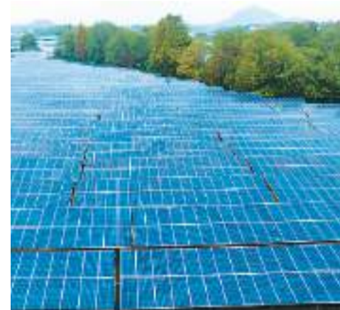
11月21日，浙江省金华市兰溪永昌绿能光伏企业太阳能光伏发电变电压输送成功并网。