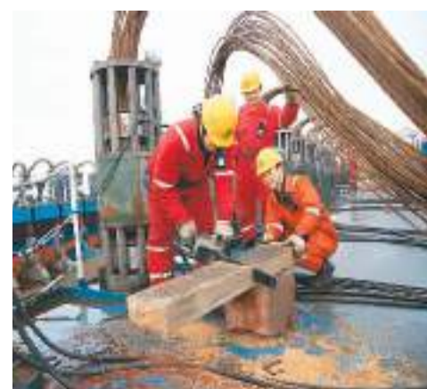
11月21日清晨，工作人员准备绑扎固定长江口二号古船船体的物件。