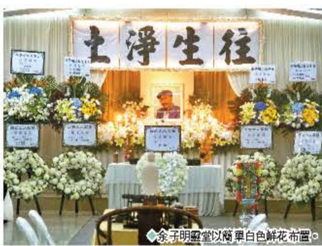
余子明設靈以簡單白色鮮花布景。

香港文匯報訊(記者 達里)資深演員余子明月初於睡夢中離世,享年80歲,其家屬27日於香港殯儀館設靈,靈堂以簡單白色鮮花布景,喪禮以佛教形式舉行,由於家屬大都信奉基督教,因此到場親友都以獻花替代上香,靈堂中央擺放子明叔的遺照,並掛上「往生淨土」的橫匾。 園中不少藝人包括汪明荃、羅家英、薛家燕、古天樂、劉俊謙、蔡思韻、演藝家協會等均有送花圈致祭,而林家棟、徐榮、趙希洛、姜大衛夫婦等就到場向子明叔作最後致意。 子明叔兒子天佑接受傳媒訪問時表示,遺照由媽媽選取:「相片應該是去年影的,媽媽覺得爸爸影得靚仔,爸爸又喜歡戴帽和留鬚。」天佑稱媽媽心情已逐漸平復,雖然到靈堂時難免會傷感,但他也安慰媽媽說:「爸爸現在走是最好的方式,我們在醫院拖住他隻手,由他眼仔碌碌給反應,到最後好像很眼瞓,一合眼就走了。」天佑又稱爸爸的遺願是再拍劇,而劇集《940920》則是他的最後遺作。 馮素波(波姐)的妹妹是子明叔的太太,她分享以前與子明叔的相處點滴,她說:「年輕時他喜歡去睇相,每次睇相都城,因為話他會好好,但是父母就享受不到。」波姐稱年輕時與子明叔經常漫無目的行街,試過由太子行到尖沙咀碼頭,又幫他在歌廳接了三個月的表演工作,他已經很開心,之後子明叔說喜歡上自己的妹妹,她就充當媒人撮合他們,波姐最後認為子明叔兒孫滿堂,此生已經無憾,並約定他下一世再見。