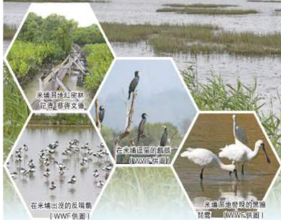
米埔濕地紅樹林