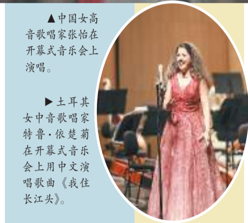
▲土耳其女中音歌唱家特鲁·依楚菊在开幕式音乐会上用中文演唱歌曲《我住长江头》。