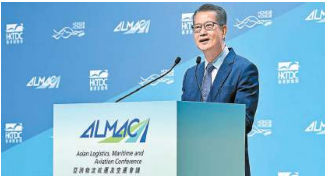
陳茂波在網誌表示，支持本港航運業朝着更高增值的「海運業集群模式」轉型。

【香港商報訊】記者蘇尚報道：財政司司長陳茂波昨日在網誌表示，本港一直保持世界十大港口的地位，儘管過去十年吞吐量呈緩慢下降趨勢，但國際金融中心及國際仲裁服務，支持本港航運業朝着更高增值的「海運業集群模式」轉型。他強調，正多管齊下鞏固和提升本港國際航運中心及國際航空樞紐的地位。