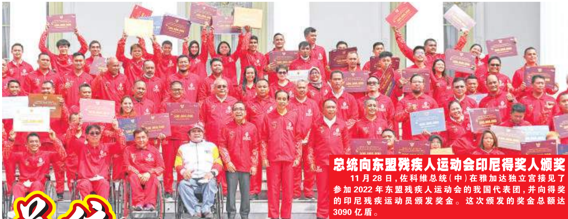
总统向东盟残疾人运动会印尼得奖人颁奖 11月28日,佐科维总统(中)在雅加达独立宫接见了参加2022年东盟残疾人运动会的我国代表团,并向得奖的印尼残疾运动员颁发奖金。这次颁发的奖金总额达3090亿盾。