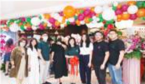
嘉宾们出席 SOMEDIMSUM 中餐厅开业仪式