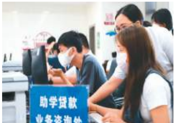
今年8月9日，在贵州省黔西市人民政府政务服务中心，志愿者在为大学生办理信用助学贷款。

“学生资助政策减轻了脱贫人群和低收入人群家庭的经济负担，帮助家庭经济困难学生顺利完成学业、实现高质量就业，为阻断贫困代际传递奠定了良好基础。”郭鹏说。2020年，有关方面共资助建档立卡学生1472万人，资助金额344亿元。脱贫攻坚任务完成后，2021年，继续资助脱贫家庭和脱贫不稳定家庭学生1400多万人，资助低保家庭学