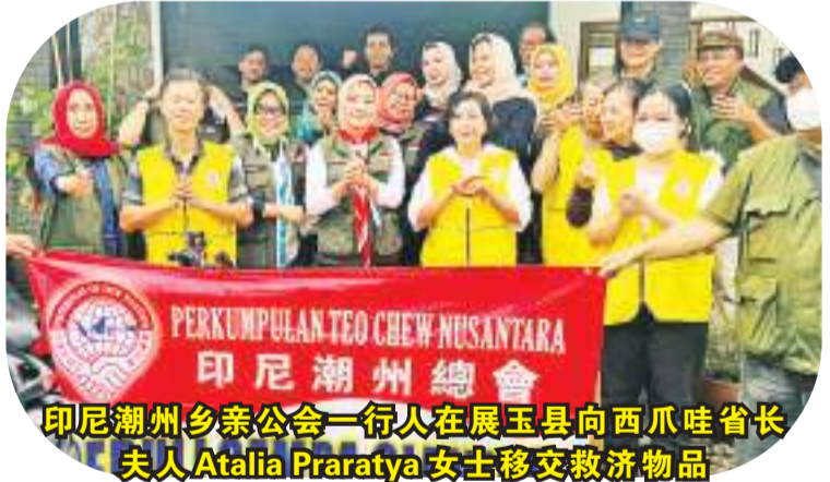
印尼潮州乡亲公会一行人在展玉县向西爪哇省长夫人 Atalia Praratya 女士移交救济物品