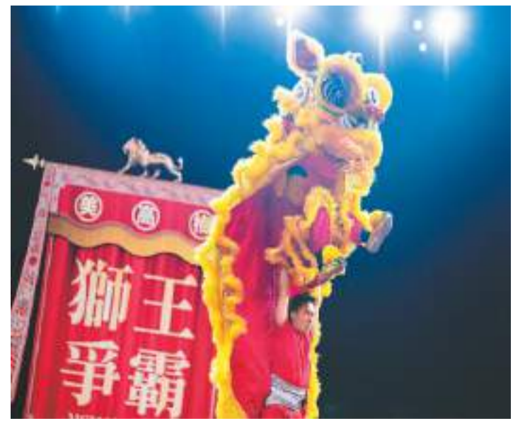
11月27日，“狮王争霸——南狮邀请赛2022”在澳门美高梅剧院举行。图为广东省深圳市新安上川黄连胜醒狮武术团队在南狮规定桩阵自选套路第一回合比赛中。

据悉，作为电商名城，近年来，宿迁市抢抓数字经济新赛道机遇，以电子商务为牵引，不断深化宿台两地各领域的交流与合作，截至目前，宿迁已成功举办8期台湾青年电子商务培训班。