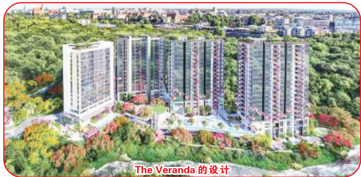
The Veranda 的设计

收费站。此外,还有各种公共设施如Pondok Indah 商场、Pondok Indah 医院、Pondok Indah 高尔夫球场、Pondok Indah Ranch 市场、Citos、The Forest by Wyl's、西马杜邦高视野(High-Scope)学校、独立学校、初学(Cikal)学校和雅加达国际学校。 据悉,西铁/Nishitetsu 于1908年在日本成立,在25个国家/地区成功开展从房地产(写字楼、商业和住宅物业)、酒店和交通(火车和公共汽车)、国际物流、零售到游乐园的各种业务。 PT. Pulauintan Baja-perkasa Konstruksi 是一家自1990年以来全国领先的建筑承包商,在承建著名的房产项目方面具有丰富的经验,例如公寓、办公室、酒店、商场、工厂、大学、慈济医院等等。 (BAM/HAN)