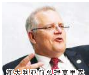
澳大利亚前总理莫里森

中新网11月28日电 据澳大利亚广播公司(ABC)当地时间28日报道,澳大利亚政府将于本周对前总理莫里森任职期间兼任多个部门部长一事提出谴责动议。