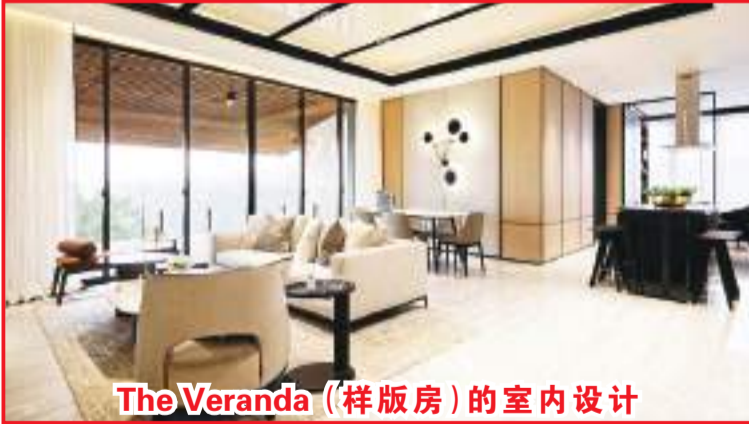
The Veranda (样板间)的室内设计

为了迎接即将到来的圣诞节和新年,The Veranda 推出圣诞节促销活动,有效期至到2022年底,并提供诱人的奖品。他说:“每购