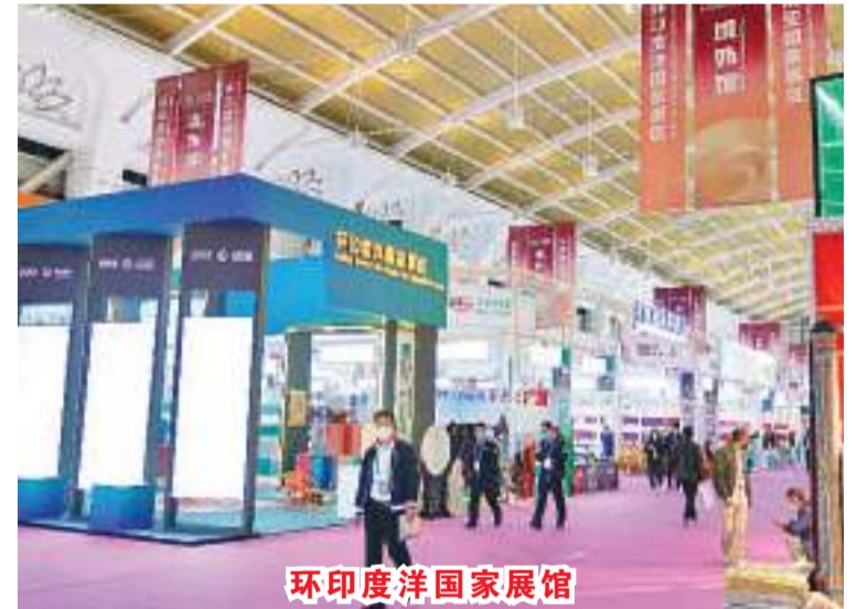
环印度洋国家展馆

【本报讯】第6届中国—南亚博览会22日在昆明闭幕。期间，来自印度尼西亚、巴基斯坦、澳大利亚等19个环印度洋地区国家以及中国的政府官员、专家代表分享了同中国的蓝色经济合作经验，积极响应构建海洋命运共同体倡议，呼吁进一步加