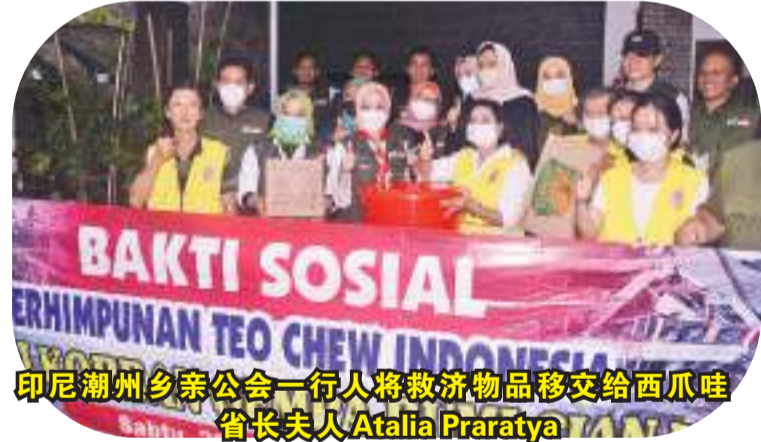
印尼潮州乡亲公会一行将救济物品移交西爪哇省长夫人 Atalia Praratya