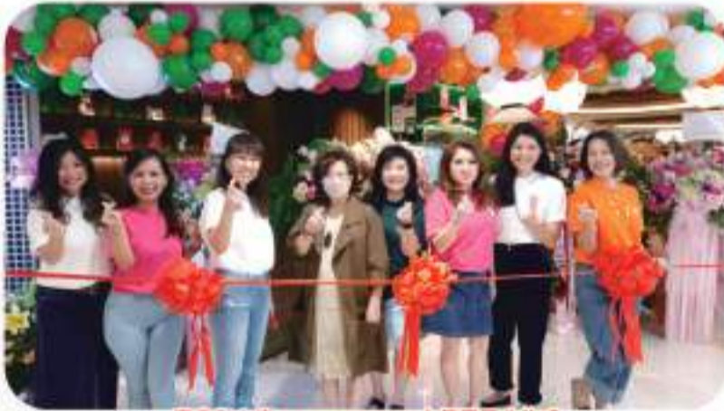
嘉宾们出席 SOMEDIMSUM 中餐厅开业仪式