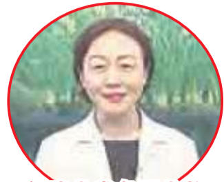
福建省常务副省长 郭宁宁致词