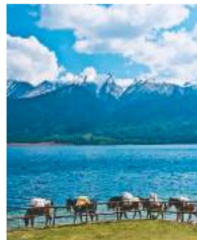
尼泊尔拉拉湖风景。

壮美山峦、清澈湖水、珍奇野生动物、七彩民族风情……迷人的尼泊尔值得游人来一场与大自然的邂逅。