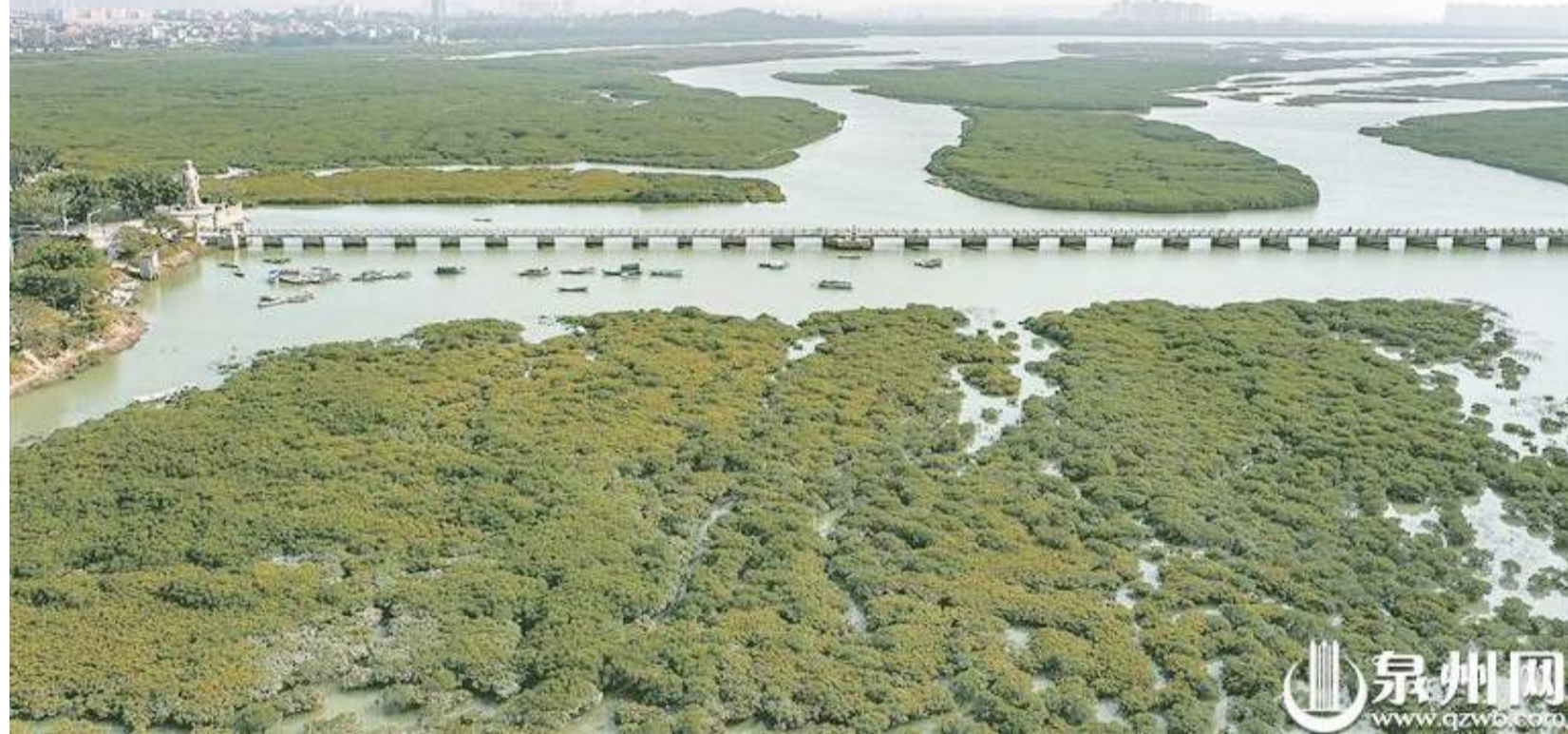
洛陽江紅樹林

日前，《濕地公約》第十四屆締約方大會閉幕，會議主題為“珍愛濕地，人與自然和諧共生”。泉州作為依山傍海的城市，濕地星羅棋布。如今有越來越多的鳥類前來棲息，更是與泉州的濕地環境獨特、生態系統複雜多樣有關。