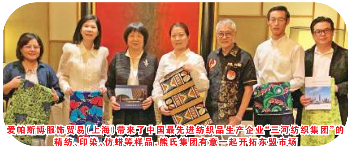
爱帕斯服饰贸易(上海)带来了中国最先进行纺织品生产企业“三河纺织集团”的精纺、印染、仿蜡等样品,熊氏集团有意一起开拓东盟市场

高、市场空间更广、创新步伐更快、发展韧性更强的国家。中印尼合作将迎来黄金五年。他希望香港利用自身的优势,积极推进“后疫情时期”的交流与合作,化