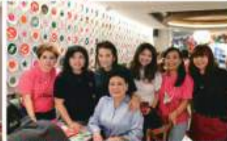
嘉宾们出席 SOMEDIMSUM 中餐厅开业仪式