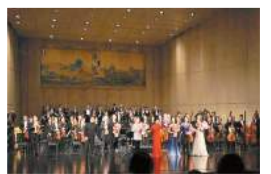
《千里江山》音樂會演出現場。

【香港商報訊】記者何松報導：日前，由深圳市寶安區主辦，深圳交響樂團承辦的交響音樂會《千里江山》在濱海藝術中心奏響。演出以交響樂的方式展現中國繪畫藝術的寫意之美，展現千里江山的壯麗景象。