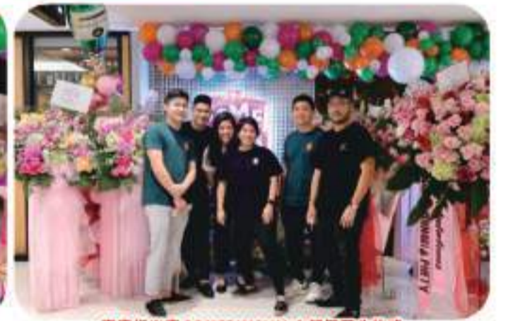
嘉宾们出席 SOMEDIMSUM 中餐厅开业仪式