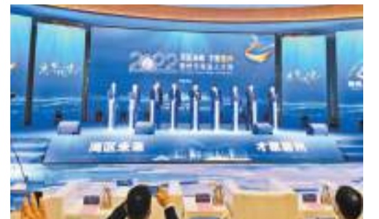
惠州市首屆人才周開幕。

【香港商報訊】記者盧偉報導：以「灣區未來 才聚惠州」為主題的2022惠州市首屆人才周活動日前啓幕，在當天的開幕式上，該市通過《致廣大人才朋友們的一封信》向全球英才發出邀約，來惠州共同發展、共同成就……活動現場還發布惠州市人才新Logo、新口號、新政策。並在未來3年，該市市級財政將投入約20億元人民幣的人才工作經費，以實實在在的舉措，服務創新創造、優化人才生態，奮力打造各類人才的青春之城、奮鬥之城。