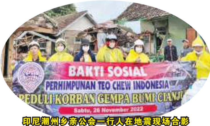
印尼潮州乡亲公会一行人在地震现场合影