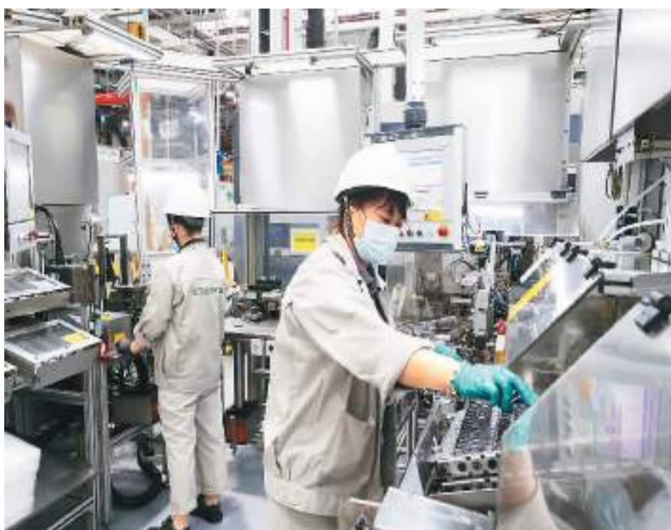
近日，江苏省苏州工业园区产业园内，德国企业安妥空调设备（苏州）有限公司的员工在忙碌。

外媒认为，在全球跨国投资低迷的背景下，外资“用脚投票”，证明中国仍是一片充满吸引力的发展热土。