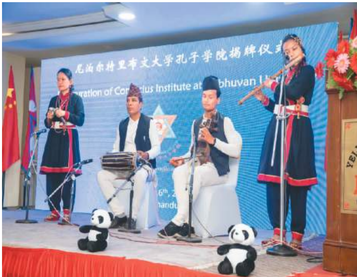
今年8月，尼泊尔第二所孔子学院特里布文大学孔子学院揭牌仪式在加德满都举行。图为表演者在揭牌仪式上演奏。

使馆还收藏了丰富多样的尼泊尔手工艺品，比如配色鲜艳的传统布料“达卡”、花纹精美的木雕“孔雀窗”……施雷斯塔大使说：“尼泊尔传统手工艺品是世界上独一无二的。”他希望通过栏目组的镜头和笔头，让更多中国朋友了解、喜爱尼泊尔民族文化。