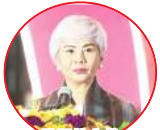
马尼拉市长 拉库娜致词