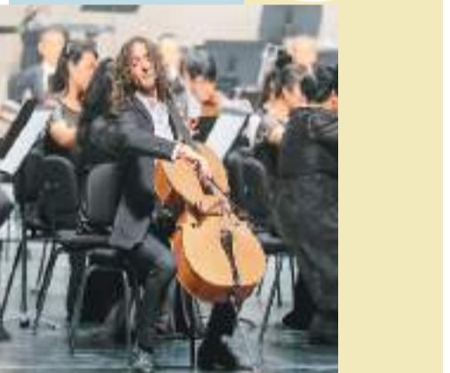
▲意大利大提琴家马伊沃在开幕式音乐会上演奏。