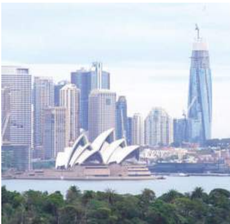
资料图:澳大利亚城市悉尼。

中新网11月28日电 据澳大利亚广播公司(ABC)当地时间28日报道,澳大利亚安全情报组织(ASIO)宣布将澳大利亚恐怖主义威胁从“极有可能”下调至“可能”。这是该国8年以来首次下调恐怖主义威胁等级。