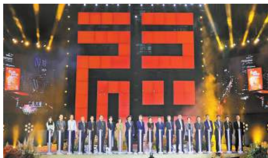
「招商引資+招才引智」全網推介大會現場。

【香港商報訊】記者姚志東報導：深圳市福田区日前在福田CBD文化金融街區舉辦「灣區有福 深愛您來」奮進新時代 福田新實踐——「招商引資+招才引智」全網推介大會。