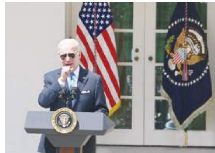
资料图:美国总统拜登。

登月并开采月球资源。据韩国国际广播电台(KBS)报道,为了实现目标,韩国政府将建设“韩国版NASA”。韩国科学技术信息通信部下将设立“太空航空厅”,总统亲自担任国家太空委员会主席。