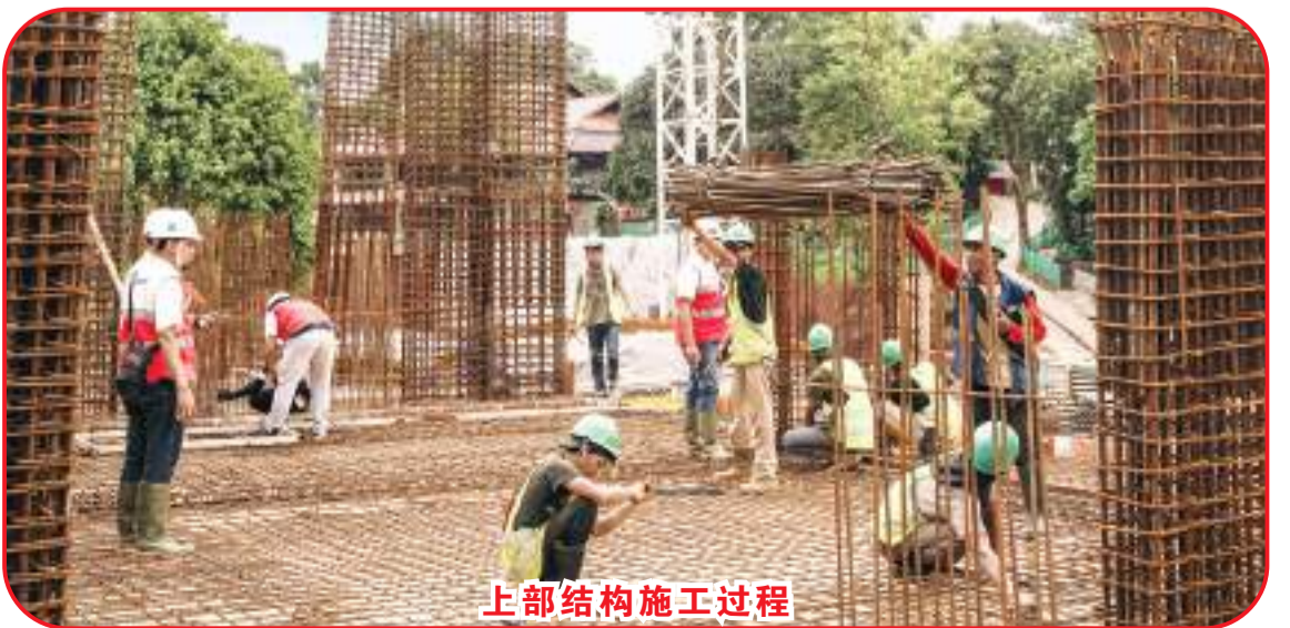
上部结构施工过程