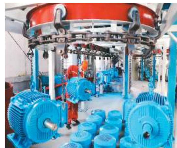
山东省东营市积极引导企业加快科技成果研发转化，提升自主品牌竞争力，推动智能制造升级，企业呈现订单稳定、产销两旺的良好态势。位于东营市东营区的胜利油田顺天节能技术有限公司是国家级高新技术企业，油田专用节能电驱装置等产品深受国内外市场欢迎。图为该公司技术人员在车间赶制订单产品。

10月份，签发票据的中小微企业8.2万家，占全部签发企业的92.1%，中小微企业签发发生额1.1万亿元，占全部签发发生额的62.6%。贴现的中小微企业9.2万家，占全部贴现企业96.6%，贴现发生额0.8万亿元，占全部贴现发生额67.4%。