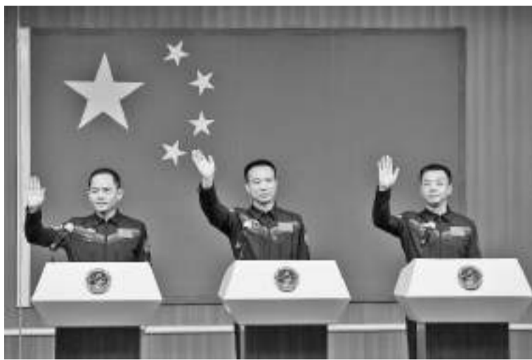
神舟十五号载人飞行任务航天员与记者见面

11月28日,执行神舟十五号载人飞行任务的航天员乘组费俊龙(中)、邓清明(右)、张陆在酒泉卫星发射中心问天阁与中外媒体记者集体见面,并回答记者提问。