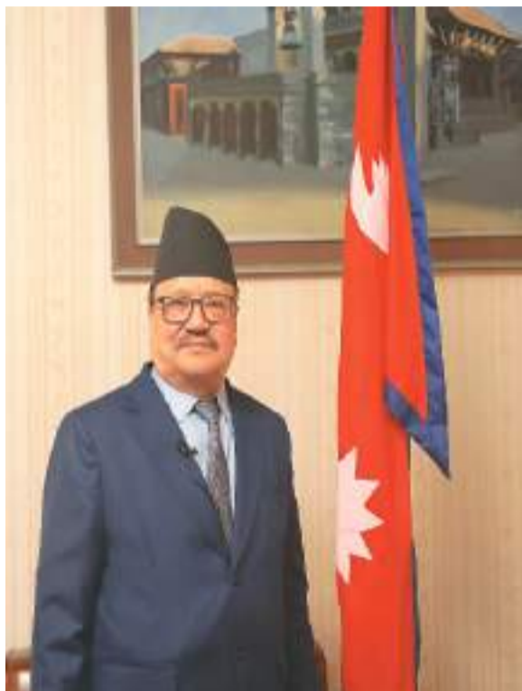
尼泊尔驻华大使比什努·施雷斯塔近照。