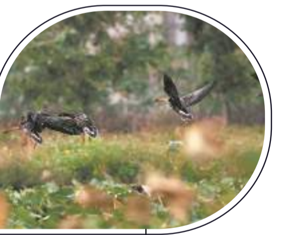
出現在晉江九十九溪的豆雁