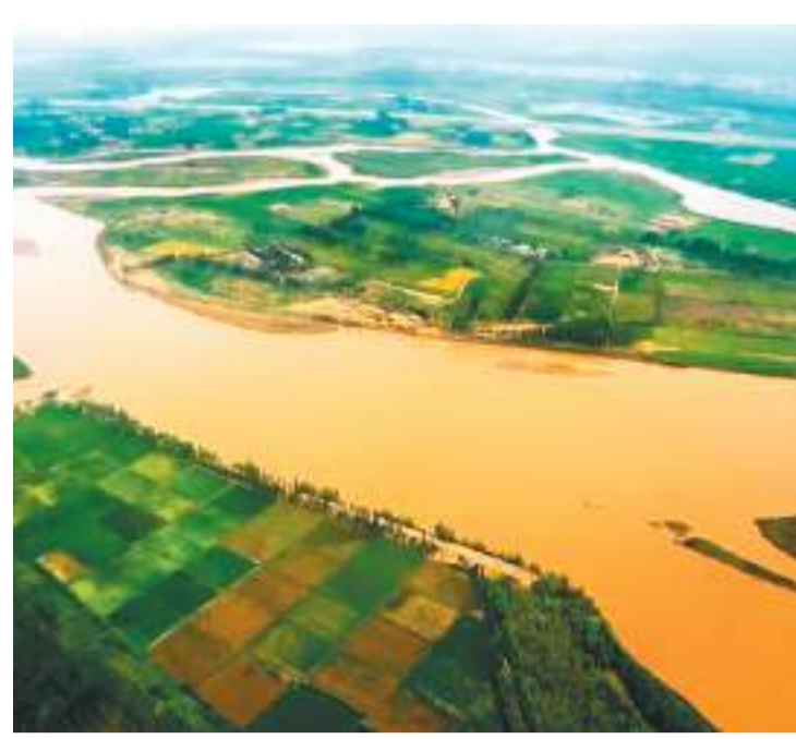
▲位于宁夏的一段黄河河道。