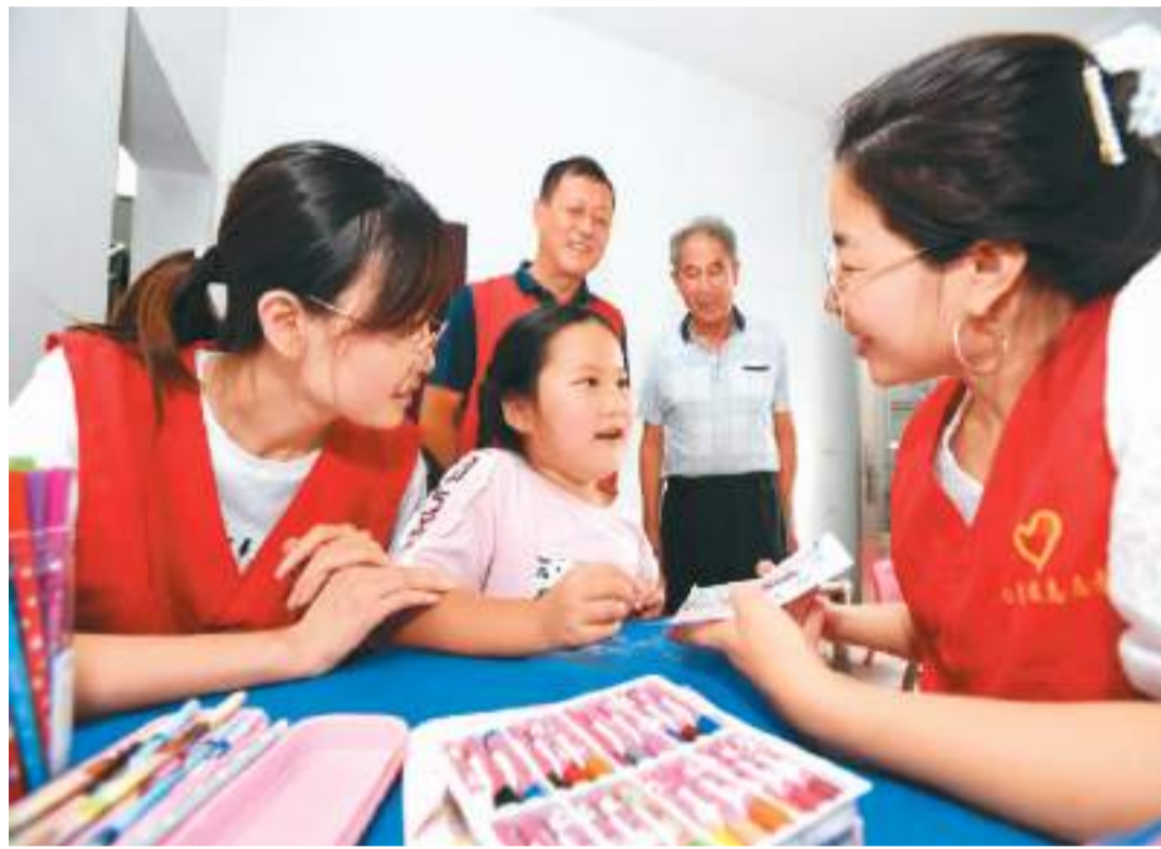
二〇二一年八月，江西省宜春市靖安县仁首镇党员志愿者和企业家走访结对困难家庭学生。

生700多万人、特困救助供养家庭学生10余万人、孤儿学生20余万人、残疾学生100多万人，年资助金额572亿元。