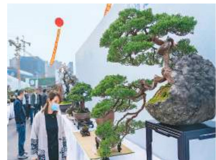
11月26日，第20届中国(金华)花卉苗木博览会在浙江省金华市金东区澧浦花木城举办。图为花木种植户在博览会上观摩盆景。

澳门轻轨延伸横琴线是澳门与横琴粤澳深度合作区之间的重要纽带，将两地居民创造舒适便捷的跨境出行环境。