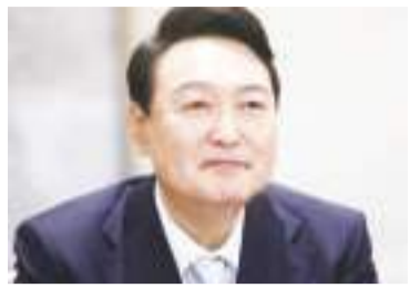
资料图:韩国总统尹锡悦

中新网11月28日电 综合韩媒报道,当地时间28日,韩国总统尹锡悦公布“未来太空经济路线图”,并表示将设立“太空航空厅”,打造韩国自己的航天局。