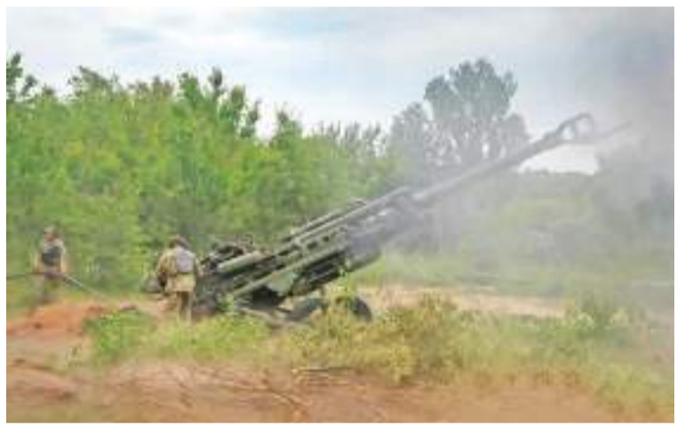
2022年6月18日，乌军士兵使用美国提供的M777榴弹炮向俄军阵地开火。

根据美国约翰斯·霍普金斯大学统计数据，截至北京时间11月28日上午，美国新冠肺炎累计感染病例达到超过9856万例，累计死亡病例达107.91万例，两项数据均高于全球其它国家。