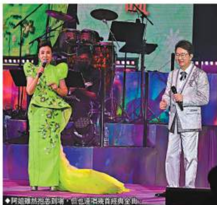
阿姐雖然抱恙到場，但也唱了幾首經典金曲。