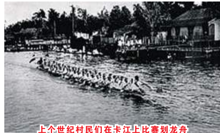
上世紀村民們在卡江上比賽划龙舟