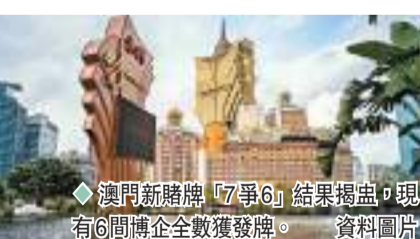
◆澳門新賭牌「7爭6」結果揭盅，現有6間博企全數獲發牌。資料圖片

香港文匯報訊（記者 馬翠嫻）澳門新賭牌「7爭6」結果揭盅，現有6間博企全數獲發牌，包括美高梅中旗下美高梅金殿超濠、銀河娛樂、金沙中國旗下威尼斯人澳門股份、新濠國際發展、永利澳門，以及澳博控股，唯一的新競爭者馬來西亞雲頂集團則出局，今次所競投賭牌為期10年。