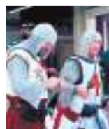
◆兩名英格蘭球迷身穿「十字軍」服裝被禁入場。

雖然包括鎖子甲和頭盔的「十字軍」服裝，在觀看英格蘭球隊比賽的球迷中十分常見，不過服裝在中東地區一直意味歧視與冒犯。在 1095 至 1291 年間，基督教軍隊為從穆斯林手中奪取聖城耶路撒冷，發動多次「十字軍東征」，導致當地大量平民喪生，是史上最殘酷戰爭之一。 ◆綜合報道