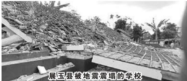
展玉县被地震震塌的学校

【本报讯】西爪哇省展玉县数百个基础设施和公共设施受到5.6级地震的影响。国家赈灾管理局指出，多达526个基础设施遭到破坏，即363间学校、144个礼拜场所、16座办公楼和3个卫生设施，另有5万6320