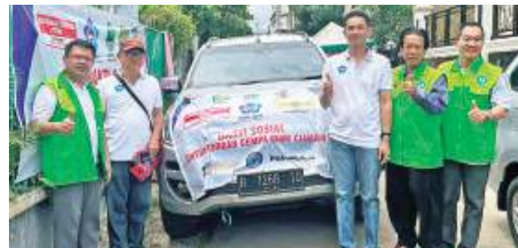
雅加达百家姓成员直接到展玉灾区赈灾