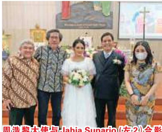
周浩黎大使与Jahja Sunarjo(左2)合影