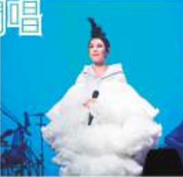
劉若英為歐洲場特製劇場版給我泡地打氣熱。

香港文匯報訊 劉若英日前到英國倫敦帕拉丁劇院，以及巴黎會議宮開唱。這回劉若英為歐洲場特製劇場版的鮫天動地飛行船，給我泡地打氣熱前往英法聯軍，光是一開場「滑翔翼滿天飛瘋狂紙花」手寫卡片，給愛到觀眾席上，就讓歌聲為之瘋狂，紙花同時象徵著劉若英終於飛到身邊唱歌給大家聽。在演唱完《彼得潘》、《為愛瘋狂》等歌後，她說：「終於我們又聚在一起了，謝謝你們！非常感動，我真的飛到你們身邊，唱歌給你們聽，也謝謝你們今天跟我一起來。」 為了給歌迷呈現自己最好的狀態，在有時差的情況下，劉若英一落地倫敦，就開始在酒店準備，調整自己。整場演唱會唱滿兩個半小時，許多經典曲目《當愛在靠近》、《原來你也在這兒》、《親愛的路人》、《成全》、《很愛很愛你》等歌，都喚起歌迷的回憶，台下粉絲的大合唱讓劉若英感動不已，她加碼釋放點歌環節，《遇見》、《漂洋過海來看你》、《她來聽我的演唱會》、《聽說》等現場點歌，誠意滿滿，讓觀眾們直呼過癮！