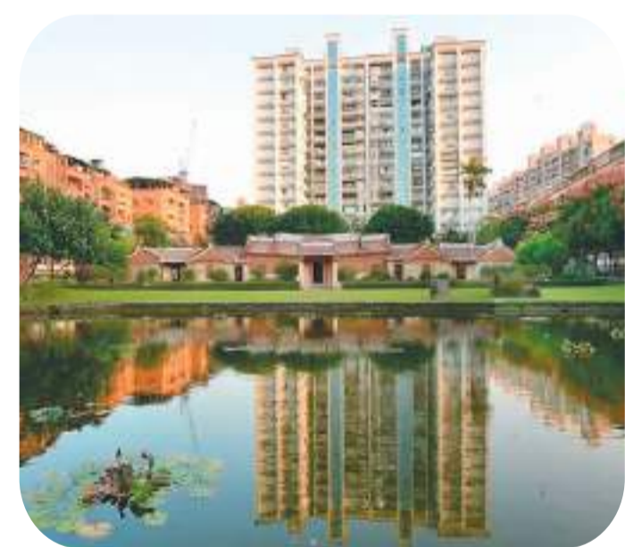
位于台湾新北的芦洲李家古宅。

始建于清乾隆年间的台北艋舺龙山寺印证了建筑学家的说法。这座中国古典三进四合院的宫殿式建筑，是台湾第一座出现轿顶式钟鼓楼与铜铸龙柱的庙宇。它是台北城市历史发展