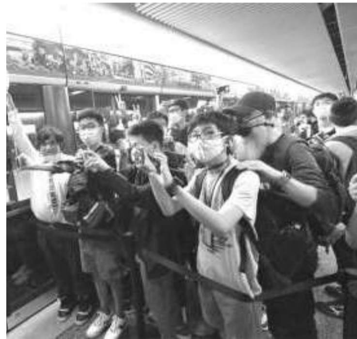
铁路迷等候港铁彩虹站“Q-train”启用。

【环球网报道】据香港星岛网27日报道,港铁国产列车“Q-train”今日(27日)在观塘线投入使用,首列“Q-train”列车于早上8时58分由港铁观塘线彩虹站2号月台开出,前往调景岭站方向,今日上午均在观塘线行驶。报道称,大批铁路迷今日一早就到场等候先睹为快,列车行驶至彩虹站开门时,一些铁路迷兴奋登车并且不时欢呼。有港媒称,有铁路迷在说“Q-train投入服务真的很兴奋”。