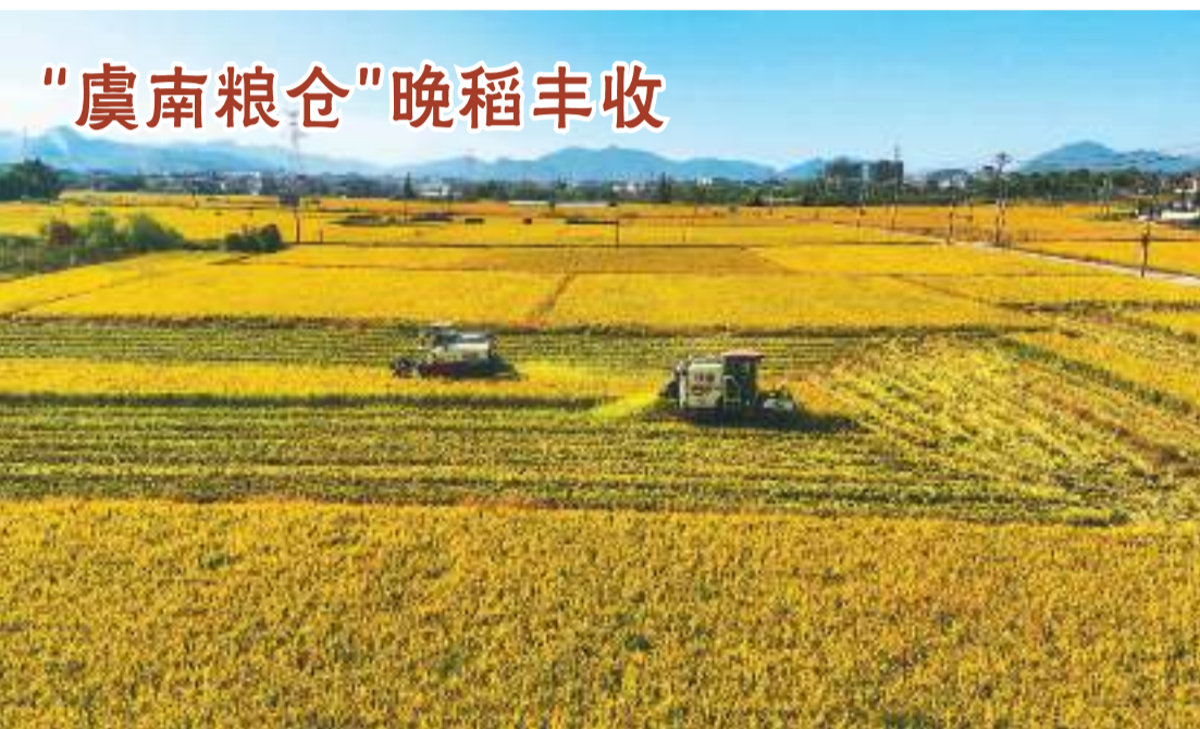
“虞南粮仓”晚稻丰收

对来华留学生提供全过程中文教学服务，加强沿线国家非通用语种等专业人才培养，破除语言不通带来的各种障碍。要探索新冠肺炎疫情常态化防控下人文交流新方式，深化教育、科技、文化、体育、旅游、卫生、考古等领域合作，推动线上线下相融合，确保交流活动不断线、不降温。要利用各种媒体手段，讲好共建“一带一路”的故事，做好政策宣介、答疑解惑工作，有理有据驳斥不实言论，营造良好国内舆论氛围。 全国政协副主席张庆黎、李斌出席会议。全国政协副主席郑建邦作主题发言。全国政协委员刘洪才、李露君、张懿宸、章启月、夏宁、阮诗玮、张博、熊水龙、杨朝明、王文银发言。国家发展改革委负责人介绍了有关情况，中共中央对外联络部、教育部、文化和旅游部参与协商交流。