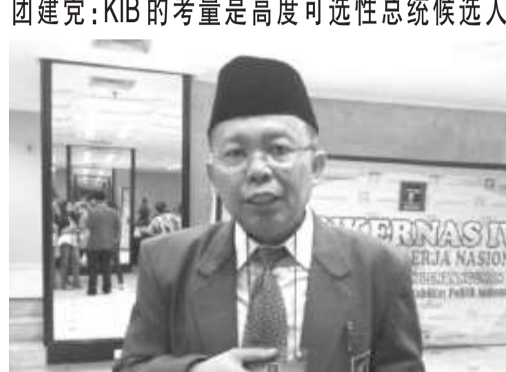
团结建设党副总主席沙尼(Arsul Sani)

【本报讯】团结建设党副总主席沙尼(Arsul Sani)日前表示，印度尼西亚尚未决定是否将推举甘比亚统一联盟(KIB)将在总统选举中排名靠前的人物为考量。当然，我们会将所