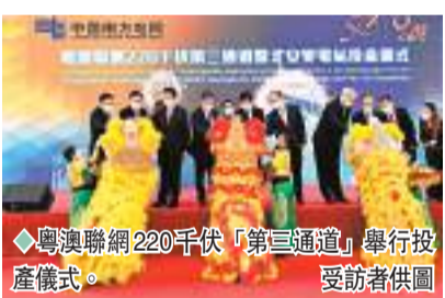
◆粵澳聯網220千伏「第三通道」舉行投產儀式。

「總體看，工業企業利潤下降，結構繼續改善，部分中下游行業利潤回升明顯。但也要看到，近期國內疫情散發多發，世界經濟衰退風險加劇，工業企業效益恢復面臨較大壓力。」朱虹說，下一步，要深入貫徹黨的二十大精神，全面落實黨中央、國務院決策部署，高效統籌疫情防控和經濟社會發展，推動穩經濟一攬子政策和接續措施全面落地見效，確保產業鏈供應穩定暢通，加快釋放消費需求，落實落細惠企紓困政策，推動工業經濟持續穩定恢復。