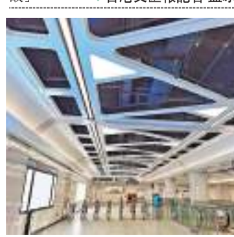
深圳地鐵12號線、6號線支線28日正式迎客。深圳地鐵線網最遠路徑為12號線海上田園東站至14號線沙田站，全程91.75公里，票價15元。◆香港文匯報記者 郭若溪

針對網絡流傳的「混陽志願者給小區做核酸」等言論，重慶官方27日上午開謠，稱其為不實信息。事發小區街道辦事處稱，發現混陽後，保安被賦紅碼並停止工作，並不存在「混陽志願者給小區做核酸」。◆香港文匯報記者 孟冰