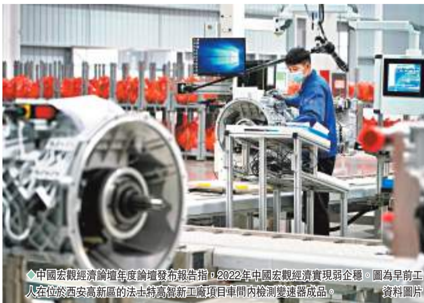
◆中國宏觀經濟論壇年度論壇發布報告指，2022年中國宏觀經濟實現弱企穩。圖為早前工人在位於西安高新區的法士特高智新工廠項目車間內檢測變速器成品。資料圖片

香港文匯報訊（記者 江鑫嫻 北京報道）中國宏觀經濟論壇（CMF）年度論壇（2022-2023）26日在線舉行，並發布年度報告。報告提出，2022年在「三重壓力」和超預期因素衝擊之下，中國宏觀經濟實現弱企穩，預計全年GDP增長3.3%，消費者價格指數增速2%。2023年將是國內外結構性因素加速進入變化的臨界點，處在關鍵轉換期。中國經濟將實現溫和復甦，在基準情形下預計GDP實際增長4.8%，名義增長6.3%。報告建議，將2023年經濟增長目標設定為5%。