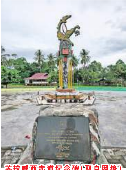
苏拉威西赤道纪念碑

隔天的第一站是一处风景秀丽的瀑布区。柴油将告罄的数辆车不敢独行,必须趁早赶去加油站排队等候。前往瀑布的车队很快就和排队等进油的车会合,下一站是经过苏拉威西的赤道线(Tugu Khatulistiwa Sulawesi),只见广场中央有一座高耸的纪念碑,用栏杆围着,石碑下的地面漆了一条粗黑的线,就是赤道线所在。队员有的爬上石碑,有的站在黑线上留影。北干巴鲁的赤道线我去过,这里反而没北干的热,或许是我们已习惯了一路的炎热气候吧。