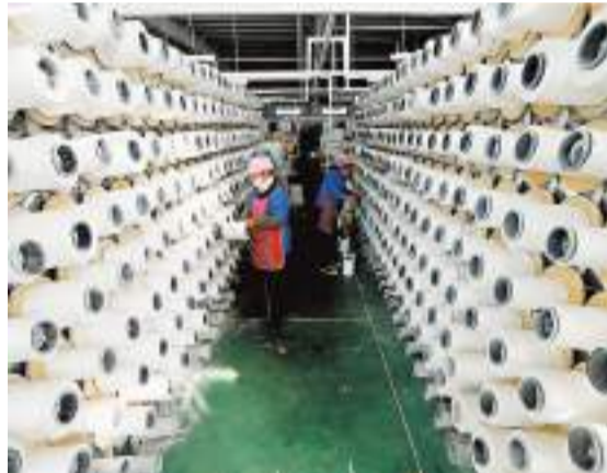
◆今年前10個月，全國規模以上工業企業營業收入同比增長7.6%，利潤同比下降3%。圖為11月24日，青島市即墨區一家蓬布生產企業的工人在織布車間忙碌。新華社

香港文匯報訊 據新華社報道，中國國家統計局27日發布數據，今年前10個月，全國規模以上工業企業營業收入同比增長7.6%，利潤同比下降3%，但裝備製造業利潤明顯回升，電氣機械行業利潤大幅增長，工業企業利潤結構繼續改善。