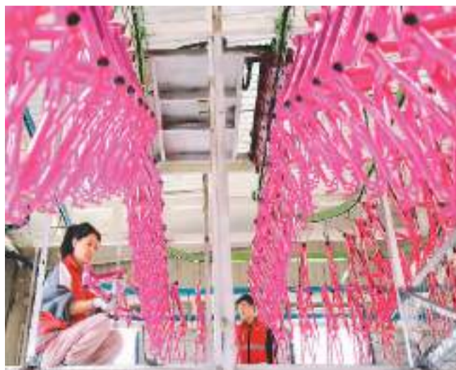
河北省邢台市平乡县大力拓展外贸出口市场，支持跨境电商企业扩大出口规模，推动外贸企业做大做强。图为近日平乡县一自行车公司员工在赶制重车出口订单产品。

城市、省会城市向二三线城市延伸。洪勇指出，值得注意的是，本次扩围包括西藏自治区拉萨市，填补了西藏地区没有跨境电商综试区的空白。此次扩围后，山东省实现了省内下辖区市的全覆盖，成为国内第四个实现省辖区市跨境电子商务综合试验区全覆盖的省份。此前，浙江省、江苏省和广东省也均实现了全覆盖。