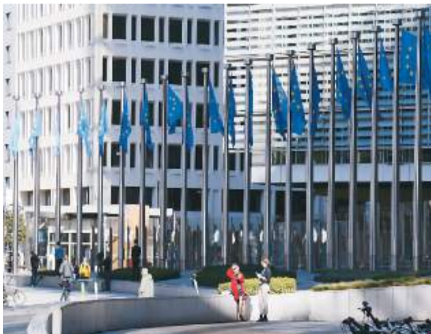
图为比利时布鲁塞尔的欧盟委员会总部大厦。

专家指出，欧洲调控措施短期性、应急性强，今年冬天欧洲可能不会出现严重能源断供。但欧洲各国政策缺乏协同，内部仍存明显分歧。长期来看，欧洲经济能否脱困，还受到能源转型进度、地缘政治局势等多重因素影响。