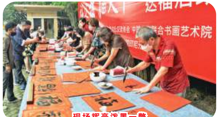
现场挥毫泼墨三瞥