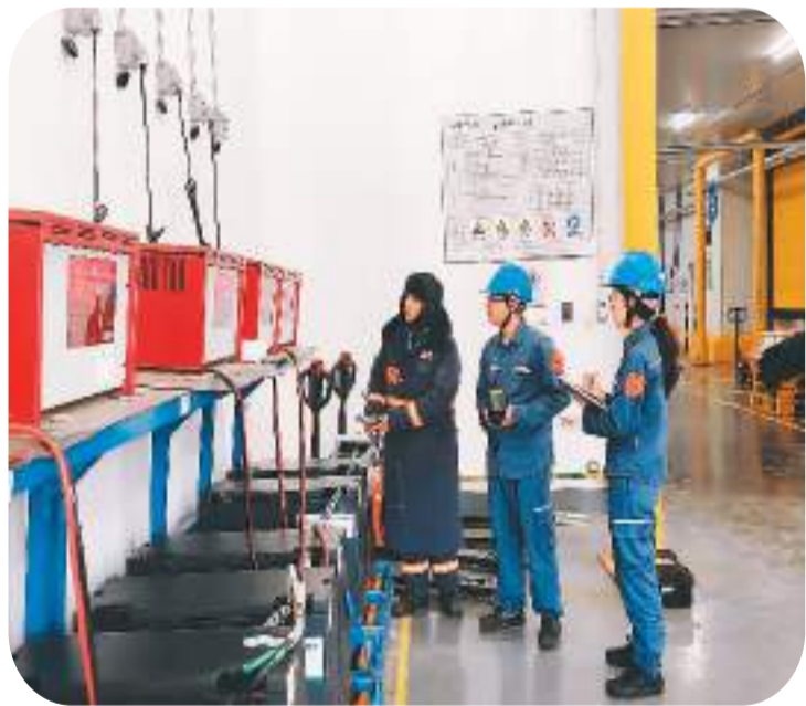
广西壮族自治区南宁供电局积极开展电力预装、即插即用服务，保障客户供电。图为南宁供电局五象供电分局“电亮五象”党员服务队深入到自贸区南宁片区中新南宁国际物流园冷库了解客户用电需求。