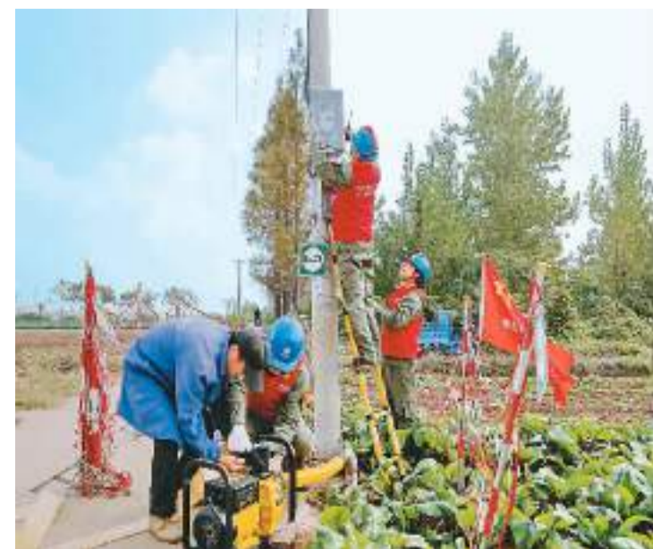
湖北省荆州市荆州区供电公司今年以来简化用电报装流程，加大对农田排灌设备及配电变压器等设施巡查力度，为农田抗旱、果蔬增收提供可靠电力保障。图为该公司李峰供电所人员在蔬菜基地检查用电线路，为引水灌溉农田提供保障。