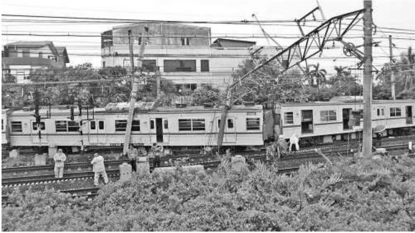
雅加达电动列车塌陷,由于工作人员正在进行疏散工作,从甘榜马来由(Kampung Melayu)至芒卡莱(Manggarai)路线的铁路不能通车。

强的五大经济体。” 值得一提的是,政府此前停止了镍矿石的出口,这项政策已将镍矿石的出口价值,从之前仅达到15万亿盾提升到300万亿盾。 但我国在世贸组织必须要面临欧盟的抗议,欧盟国家对佐科维停止出口镍矿石的政策提出了诉讼,最终世贸组织裁定我国败诉。(Sm)