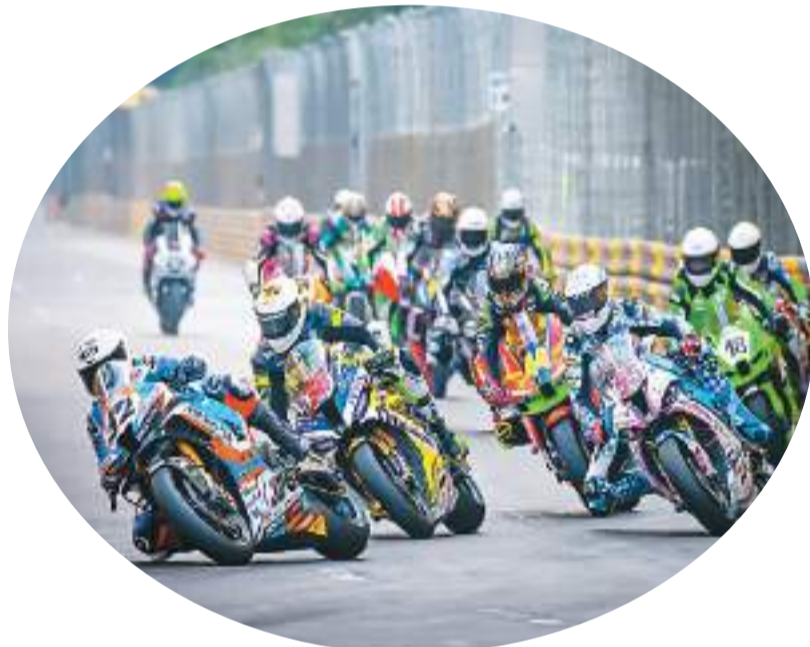
澳门格兰披治大赛车比赛现场。

澳门特区文化局表示，澳门历史城区凝聚了丰富的人文色彩，具有糅合中西文化的独特韵味。未来将举办更多特色文艺项目，推动建设澳门作为以中华文化为主流、多元文化共存的交流合作基地，同时发挥文化与旅游的联动效应，进一步丰富澳门文旅体验元素。