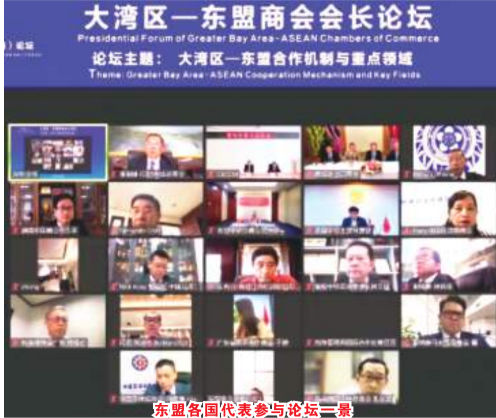
东盟各国代表参与论坛一景