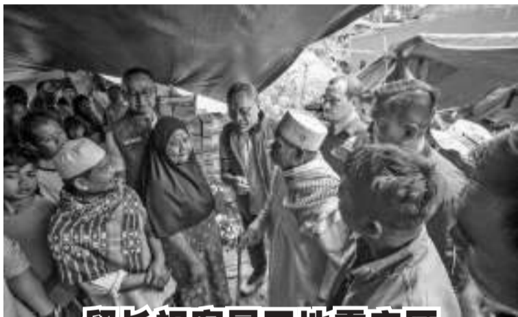
贸易部长祖基菲(Zulkifli Hasan / 中)到展玉县Cikamuning乡灾民进行视察时,已向地震灾民提供了25亿盾的援助金。