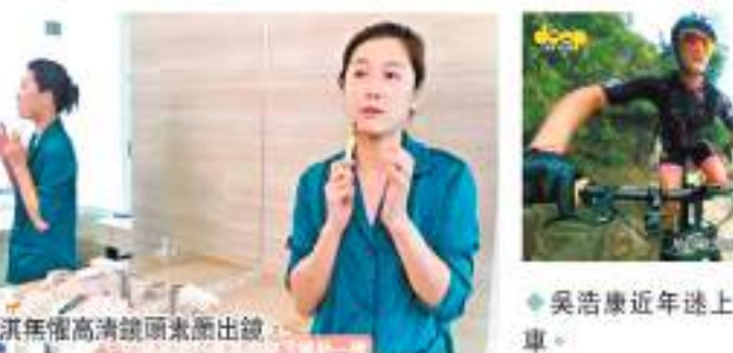
周勵淇無懼高清鏡頭素顏出鏡。