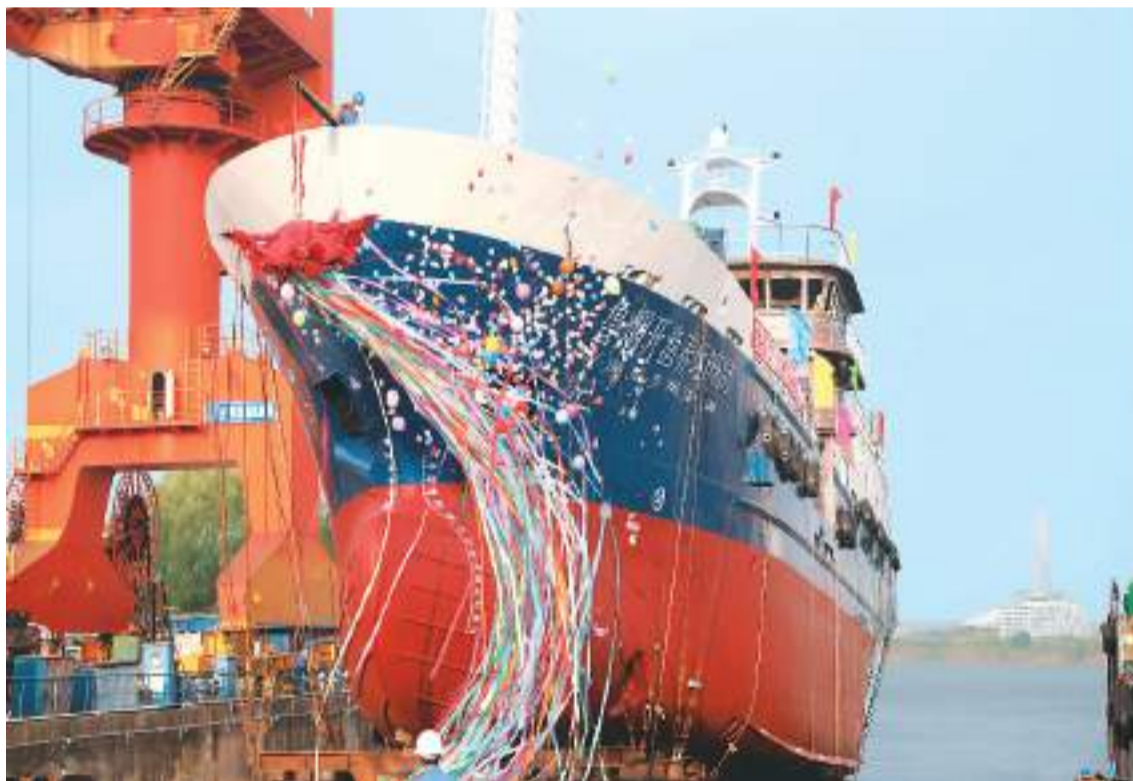
11月25日，中国自主设计建造的海洋生态活鱼运输船在江苏省镇江市顺利下水。该船由江苏省镇江船厂（集团）有限公司为山东烟台经济海洋渔业有限公司建造，设计安装了国际先进的活鱼装卸装置，配备了水循环、二氧化碳去除等适用于活鱼养殖的环境控制维生系统，实现了对全船活鱼动态信息和数据的全程监控。

其中，货物贸易顺差4088亿美元；服务贸易逆差567亿美元。按美元计值，2022年10月，我国国际收支货物和服务贸易出口2945亿美元，进口2451亿美元，顺差494亿美元。