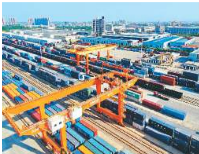
江西省赣州市积极推进赣州国际陆港、赣州综合保税区与中国（赣州）跨境电子商务综合试验区“三区合一”，实现“中欧班列+跨境电商”融合发展。图为赣州国际陆港铁路站场的繁忙景象。

从地域分布上看，本次新设的33个跨境电子商务综合试验区所在城市外贸基础较好，地理分布上更加重视中西部地区和边境地区，逐渐由东部、南部沿海地区向内陆省份扩展，从中心