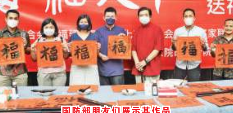
国防部朋友们展示其作品