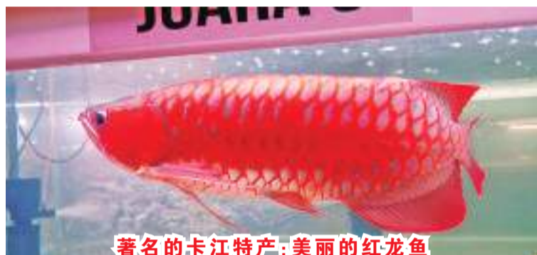
著名的卡江特產：美麗的红龙鱼

我是印尼最長的河流卡布亞斯河 (Sungai Kapuas)，簡稱卡江。我發源於加里曼丹島腹地的一个大湖“Danau Sentarum”，全長 1143 公里的我從東向西，匯合了不計其數的小河小溪，經過高山，經過平原，有時彎彎曲曲，有時一瀉千里，還有不少飛流直下的瀑布一路相送，我時而高歌猛進，時而低回吟唱，沿途經過不少鄉鎮城市，最後來到了赤道之都——西加里曼丹省省會坤甸市的河口，浩浩蕩蕩地注