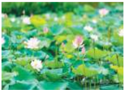
个人奉上的，都是包裹在食物中的爱意。

龙井茶甜香醉人而口齿回甘，沁人心脾。我们聊人生中的各种改变，各种让我们愉快的事情。有的小伙伴在疫情中拿了第二个硕士学位，也有的小伙伴要再进学校深造。有人要把现在的生意卖了干点别的，有人在计划退休。坐在农家乐的大树荫里，我们品尝人生的各种滋味，也品尝人生的过往。