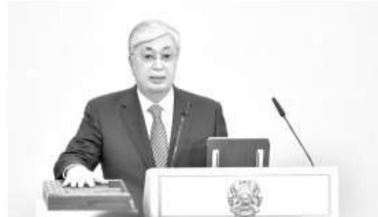
当地时间26日,哈萨克斯坦总统托卡耶夫发表就任演说

结。”发射场首席气象预报专家李兴东说。 神舟十五号飞船组合体运抵发射区后,已经完成了飞船和火箭功能检查、匹配检查,组织了全系统发射演练,后续将按程序进行火箭推进剂加注和发射工作。 “针对这次低温发射特点,发射场各系统持续开展设施设备状态复查,我们有准备、有信心、有能力完成发射任务。”酒泉卫星发射中心副主任王学武说。