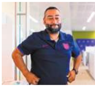
◆片中亞倫穿著英格蘭球衣。

交部為支持國家隊而拍攝，現實中當然沒有任何外交官被炒，一切都只是以幽默方式為球隊打氣。 ◆綜合報道