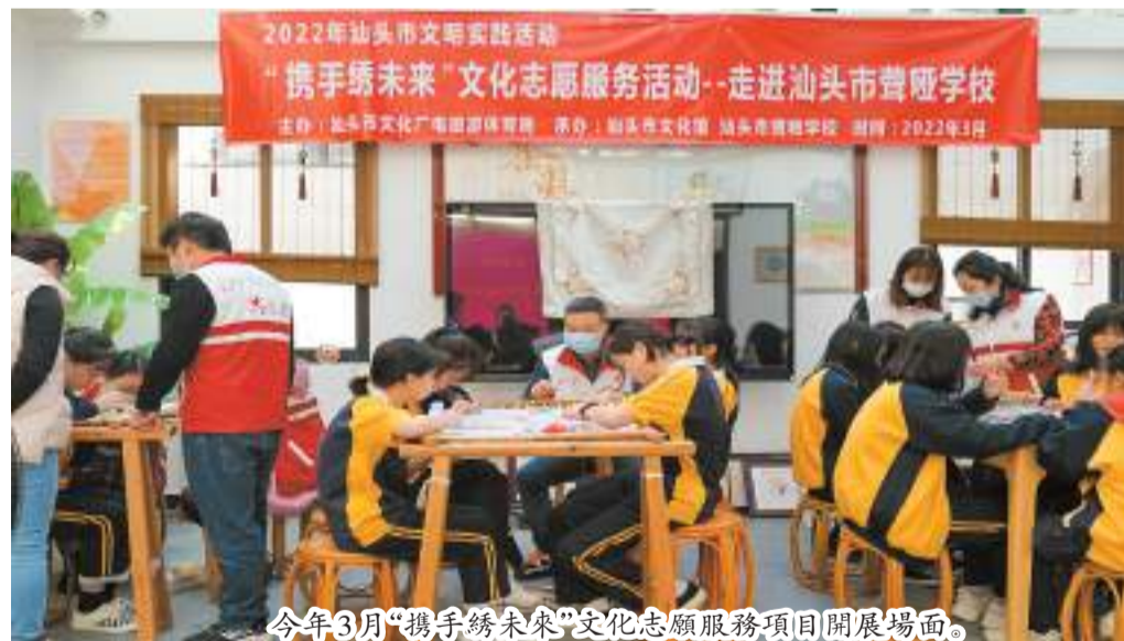
今年3月“攜手綉未來”文化志願服務項目開展場面。

從重點產業項目投資情況看，今年前三季度汕頭市產業工程完成投資111.87億元，占全部重點項目完成投資的19.3%。其中，電子信息、生物產業工程、高端裝備製造工程、新材料產業工程、傳統產業升級工程、農林牧漁項目完成投資進度較快，均高于產業工程完成年度投資計劃。(黃澤泰)