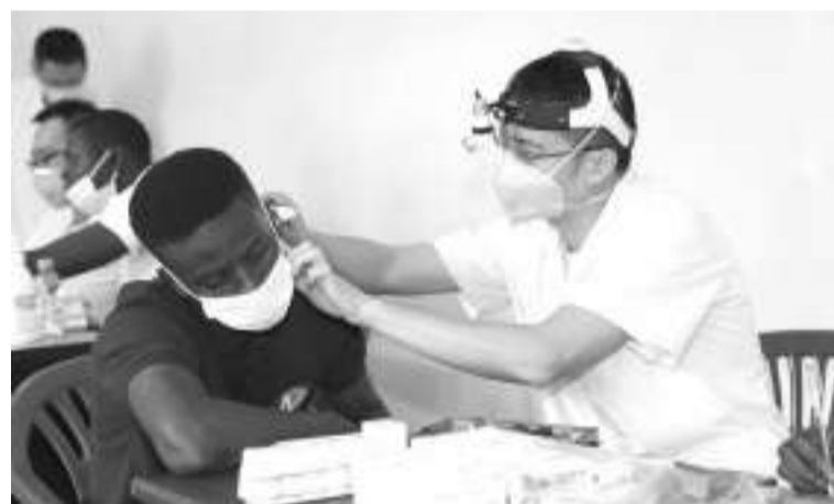
11月26日,在塞内加尔首都达喀尔,中国医生为病人进行诊疗。

中国第19批援塞内加尔医疗队26日在首都达喀尔市中心梅迪纳街区进行义诊活动,为当地民众和华侨华人问诊送药。义诊活动安排在梅迪纳一所街道学校,内容包括内科、