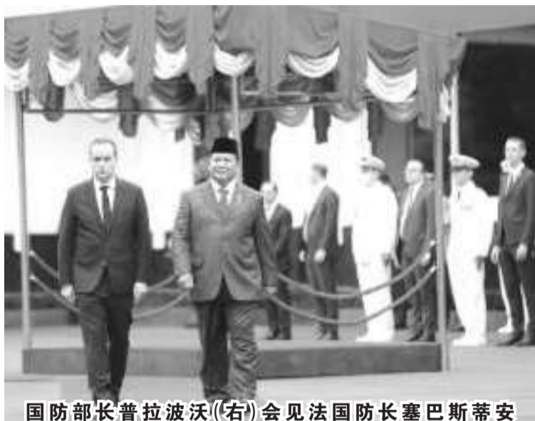
国防部长普拉波沃(右)会见法国防长塞巴斯蒂安

普拉波沃表示，有必要提高自我能力，为未来的国军领导人做好准备。法国是我们重要的友好国家，长期以来与印尼在防务领域建立了相