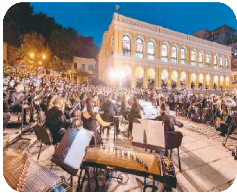
“乐韵悠扬大三巴”活动演奏现场。

引擎轰鸣、美食飘香、音韵悠扬……连日来，澳门全城联动，“狂欢嘉年华”模式正式开启，格兰披治大赛车、澳门美食节、大三巴音乐会等一系列活动轮番上演、精彩不断，让市民和游客乐享濠江小城的别样风情。