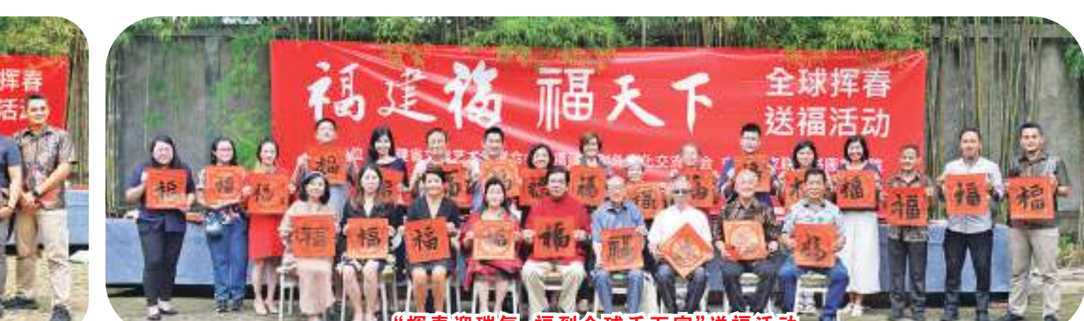
“挥春迎瑞气，福到全球千万家”送福活动