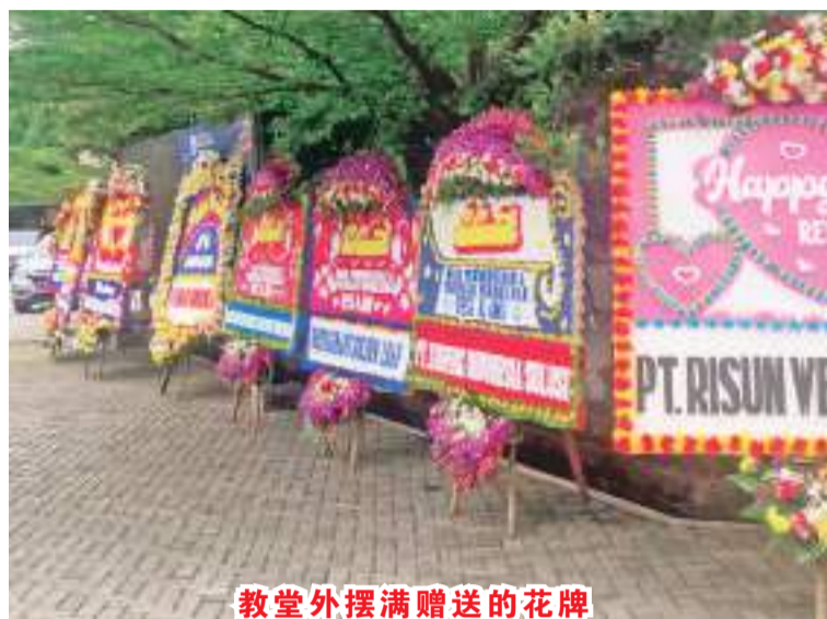
教堂外摆满赠送的花牌