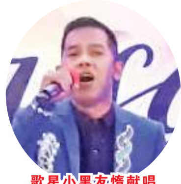
歌星小黑友情献唱