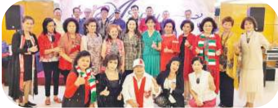
美妙歌声中友情合照