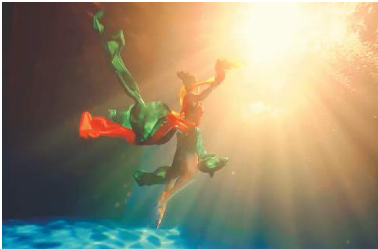
河南卫视《洛神水赋》节目的成功，被认为是高科技与中华优秀传统文化融合碰撞，并用年轻人喜欢的方式演绎的结果。