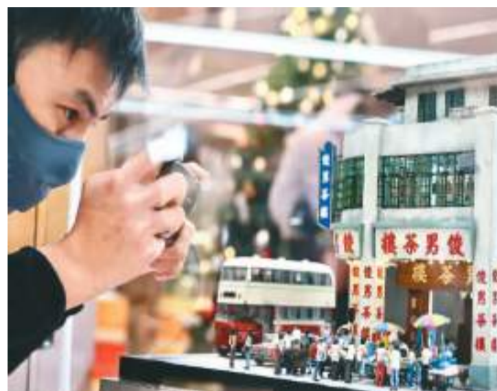
“小香港·大节日”微型艺术展近日在香港湾仔心广场开幕，该展览以圣诞及农历新年为主题，展出约60件展品，作品包括中环兰桂坊、石板街、西环码头等香港传统地标和长洲抢包山、大坑舞火龙等香港非遗项目。图为市民在观赏微型作品《俊男茶楼》。

此次活动由香港大公文汇传媒集团主办，中国文化传媒集团有限公司联合主办，国家文化和旅游部国际交流与合作局（港澳办办公室）等担任特别支持机构。