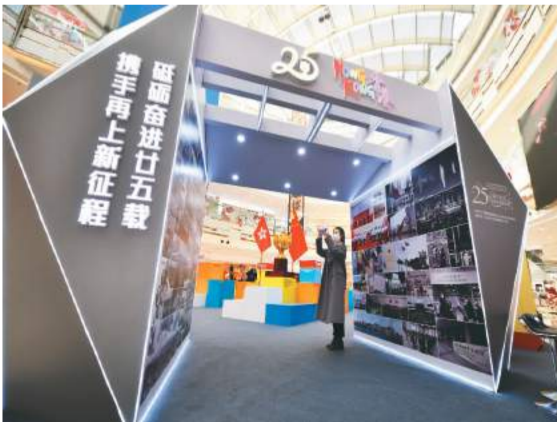
“香港回归祖国25周年——砥砺前行廿五载，携手再上新台阶”巡回展近日亮相河北石家庄。据介绍，展览涵盖法治、经贸、教育、民生等多个领域，以详细的图文资料、生动丰富的视频及充满动感的互动游戏，让观众在展览中感受香港回归祖国以来取得的卓越成就。