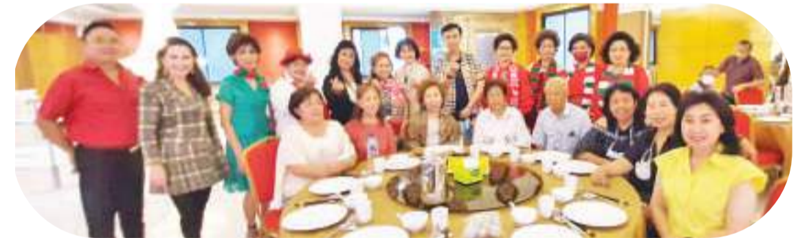
美妙歌声中传友情