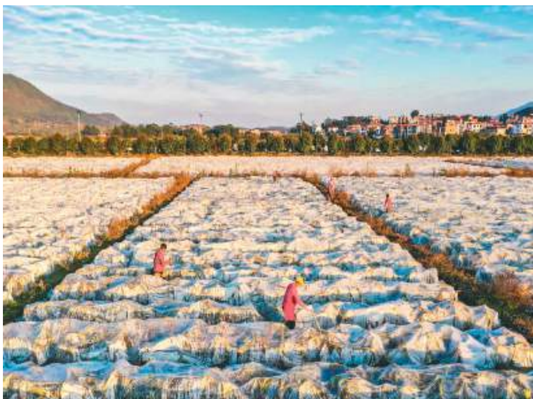
冬至节气来临,各地农民抢抓农时,开展冬管、冬种、冬收等农事活动,田间地头一派繁忙。图为在湖南省永州市蓝山县六甲村,芋农管护覆膜的芋芋。

以家庭农场、农民合作社、农业企业等为主的新型农业经营主体,成为推动现代农业发展的重要力量,各类社会化服务组织总数达到104.1万个,有力带动小农户与现代农业发展有机衔接。加快推进农业现代化的美好蓝图,在广袤乡村不断铺展。(下转第二版)