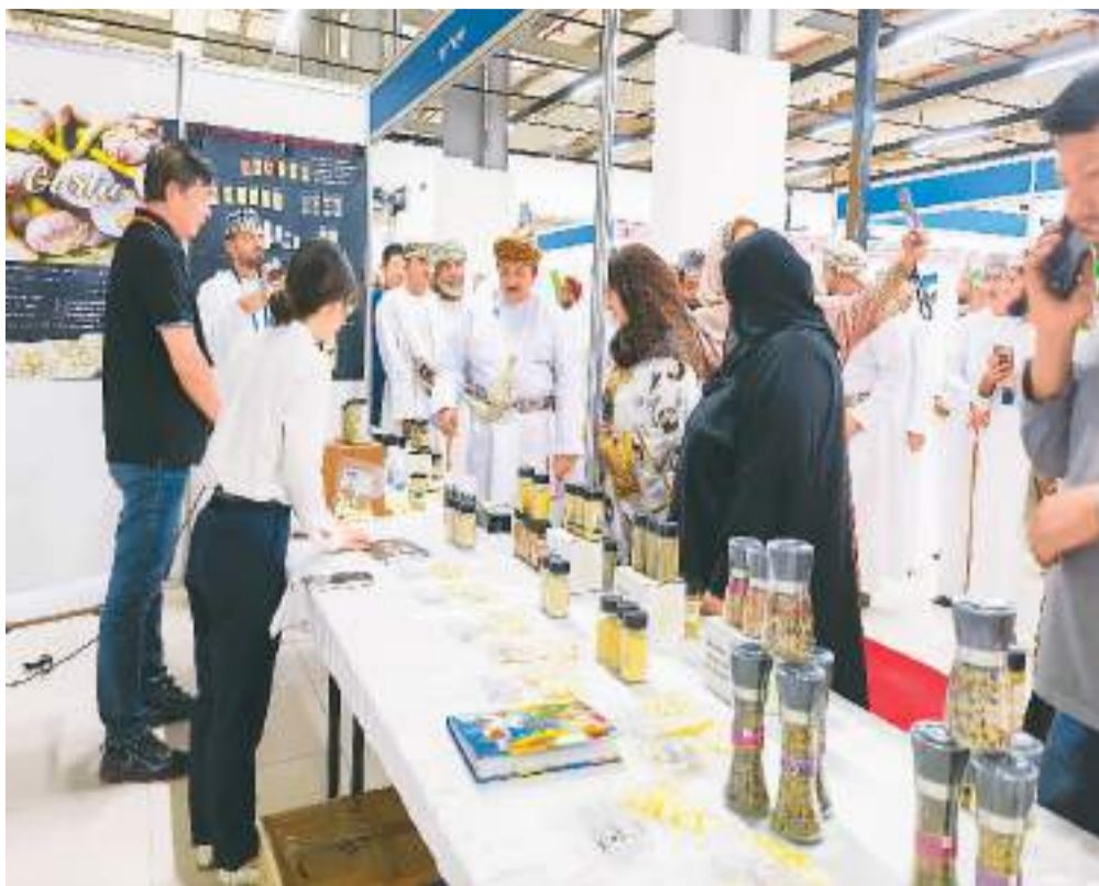
图为在阿曼巴尔卡市的阿曼中国批发城，山东出口商品(阿曼)展览会暨市场采购贸易试点展览会举行。

首届中国—阿拉伯国家峰会日前在沙特首都利雅得举行。中国国家主席习近平在会上发表题为《弘扬中阿友好精神 携手构建面向新时代的中阿命运共同体》的主旨讲话，引发阿拉伯国家华侨华人持续热议。多名旅阿侨胞在接受本报记者采访时表示，期待中阿合作释放更多新机遇，愿为中阿友好贡献更多侨力量。