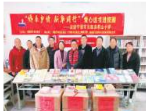
图为“侨系乡情 新华同行”爱心送书进校园活动在福建省宁德市古田县前山小学启幕。郑晓凤摄

捐赠活动结束后，嘉宾们参观了去年刚落成的古田县华侨文化展示馆。古田县作为“闽东第一侨乡”，海外古田籍侨胞达30多万人，为旅居地与家乡各项社会事业作出积极贡献。(来源：中国侨网)