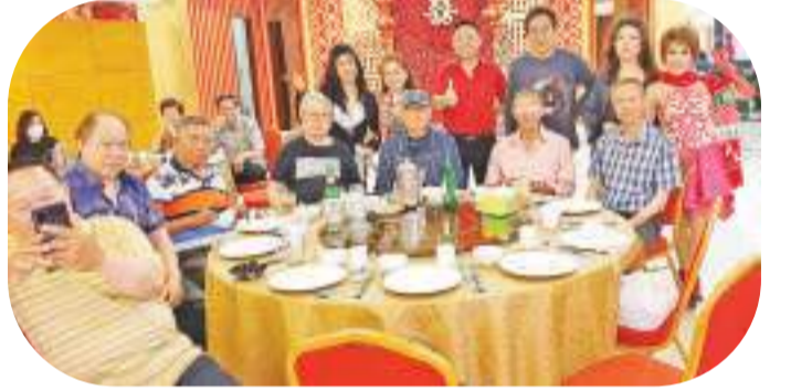
美妙歌声中传友情