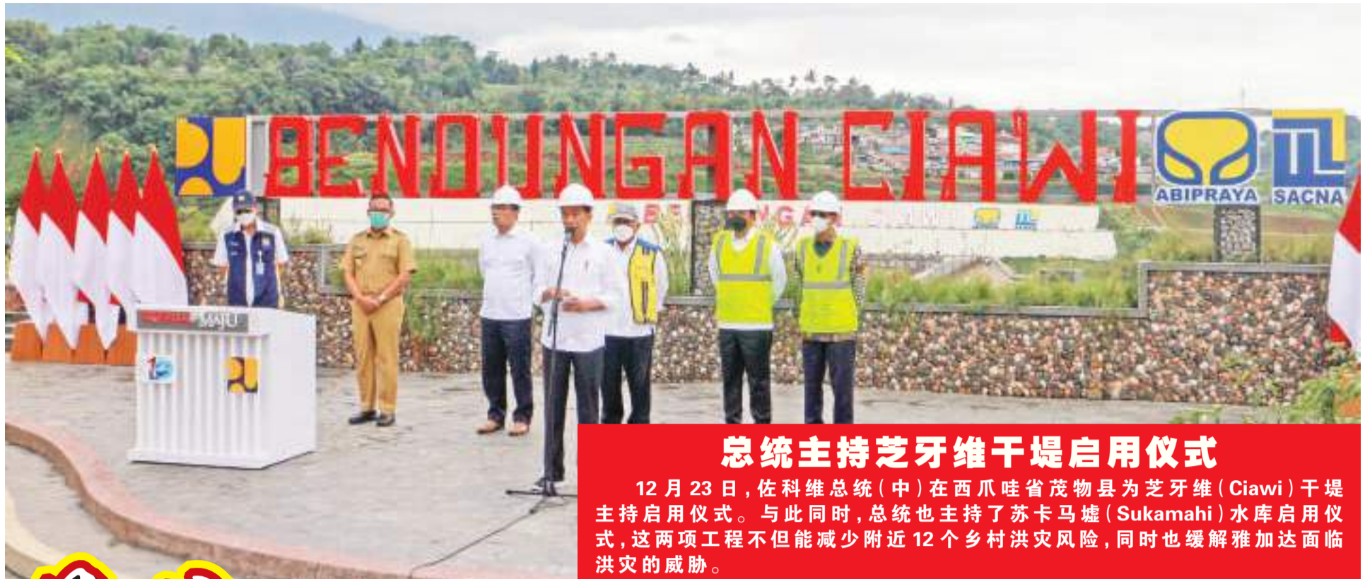
总统主持芝牙维干堤启用仪式 12月23日,佐科维总统(中)在西爪哇省茂物县为芝牙维(Ciawi)干堤主持启用仪式。与此同时,总统也主持了苏卡马墟(Sukamahi)水库启用仪式,这两项工程不但能减少附近12个乡村洪灾风险,同时也缓解雅加达面临洪灾的威胁。