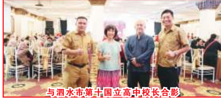
与泗水市第十国立高中校长合影