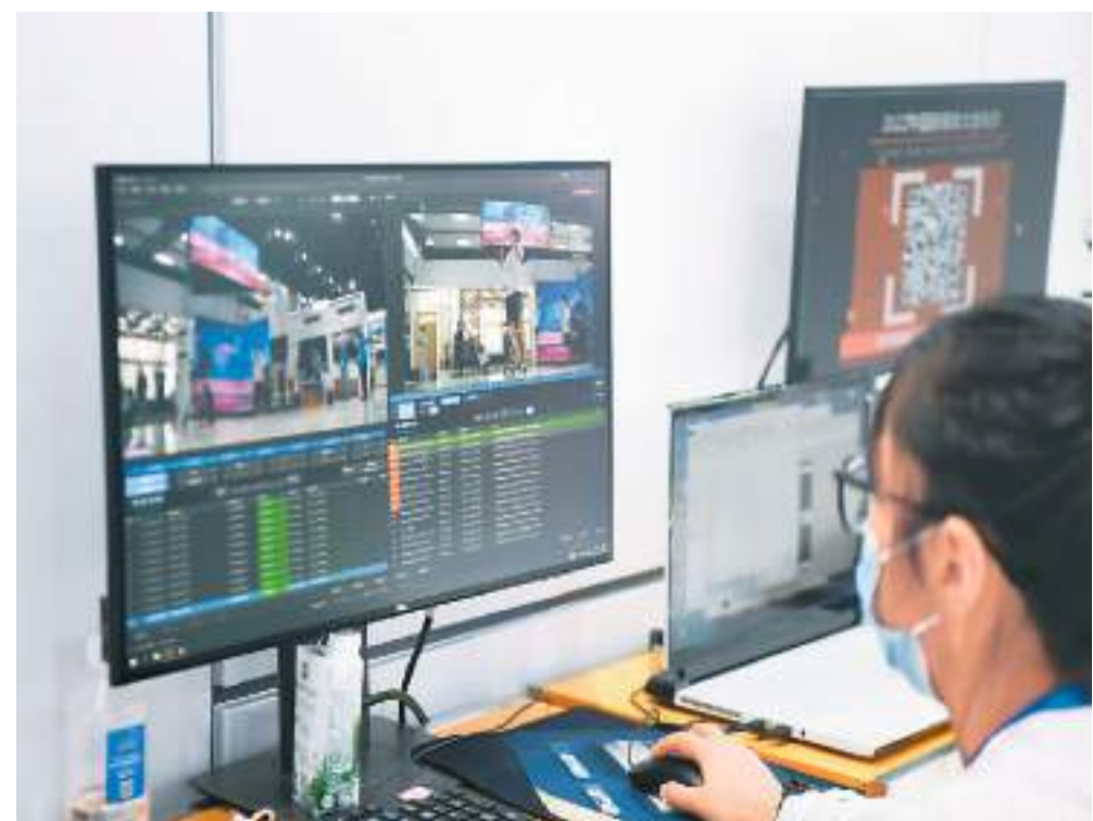
工作人员在“新技术 融创新高地”2022中国新媒体技术展上展示广播级超高清时空凝结自由视角互动系统。

业内人士称，未来要增强新型显示产业的自主创新能力，发挥新型举国体制优势和超大规模的市场优势，加强关键核心技术攻关，解决中国新型显示产业产业链关键材料和核心装备的卡脖子问题，实现核心技术的自主可控。同时，要构建产业协同创新生态，推动形成上游材料企业、下游面板终端企业形成协同创新，掌握关键核心技术和自主创新能力的龙头企业，牵头上下游企业共同打造创新联盟，推动新型显示企业与人工智能、虚拟现实企业跨界创新，打造多元化参与的创新生态。