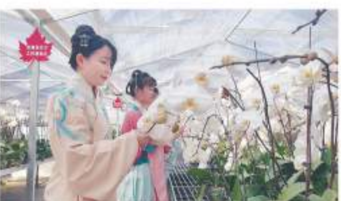
首屆蝴蝶蘭賞花節現場，遊客欣賞蝴蝶蘭。

在涉林生態環境刑事案件中，被告人不僅要承擔刑事責任，還需承擔生態修復責任。以往，“補種復綠”等直接修復方式是主流做法，其局限性在於難以第一時間全方位修復受損生態。而“碳匯”補償彌補了生態環境受到損害至修復完成期間的損失，以達到替代性修復生態環境的目的，將實現一個更大範圍內的溫室氣體平衡甚至減排，從而更好地用於抵消生態環境受損地的碳匯量。