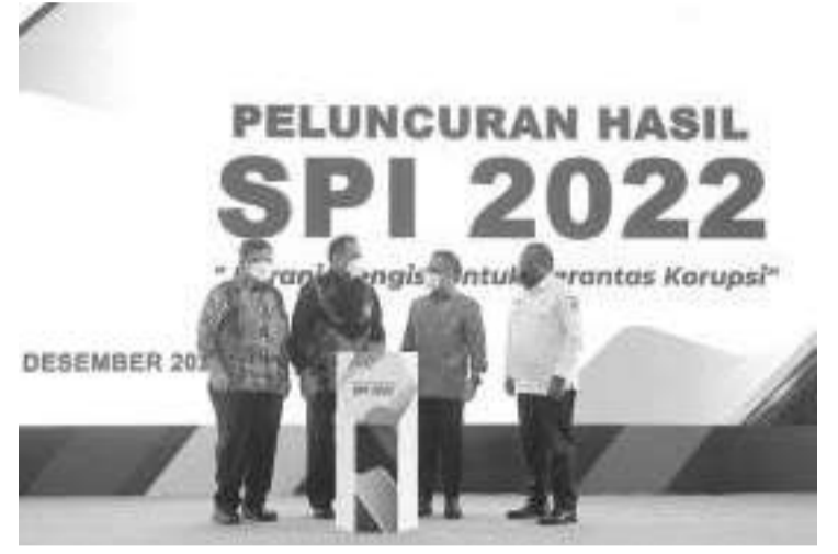
肃贪委主席费尔利(左二)公布2022年诚信评估调查结果国警评分暴跌为75.82

能力在其他地方获得卫生服务的富人。卫生部长古纳迪表示，卫生社保机构服务必须被社会各阶层，无论贫富都能感受到。这是继其在全国委员会举行的工作会议上的讲话之后，当时，他指出，卫生社保机构被包括有钱人在内的富裕群体广泛使用。它必须设计得各部很好，社会保险对索赔的过度支付担心会损害其可持续性，这是因为不少大型保险公司陷入困境。古纳迪周五(25/11)在雅加达香格里拉大酒店与媒体会面时，他表示，卫生社保机构必须为所有国民服务，包括穷人和富人。我再再说一遍，理想情况下，卫生社保机构应该覆盖2.7亿国民，无论他们是什么人，但是必须再行精心设计。(亮剑)