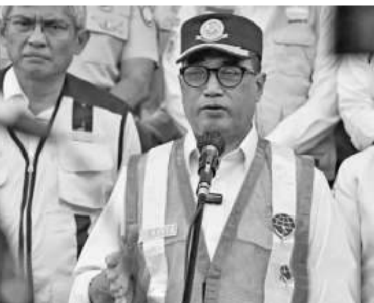
交长要求民众警惕极端天气 交通部长苏马迪(Budi Karya Sumadi)于12月23日在高速路管理公司(Jasa Marga)办事处举行统筹会议后举行新闻发布会,他希望民众警惕年终出现极端天气的可能性。