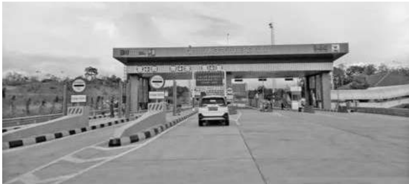
明古鲁高速公路正式投运 从今日(12月23日)开始,从明古鲁(Bengkulu)-Taba Penanjung高速公路已正式全面投运,而且还是免费通车。