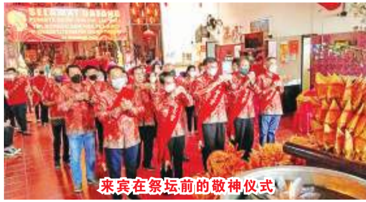
来宾在祭坛前的敬神仪式

【本报讯】为纪念公祖三保大人诞辰651周年，TITD Sam Poo Sing Bio 或 Mbah Ratu 寺庙举办了敬神聚会，邀请了东爪哇、中爪哇和西爪哇的许多寺庙代表出席。