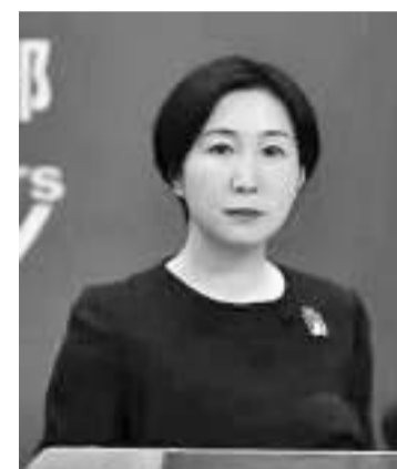
外交部发言人毛宁