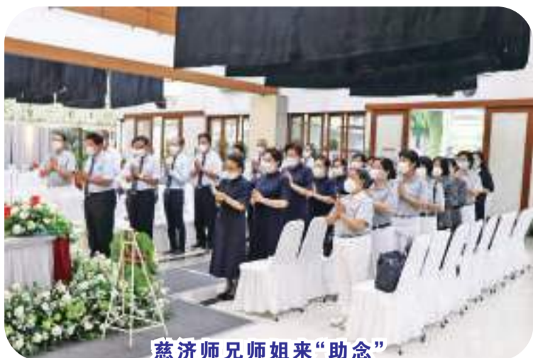
慈济师兄姐来“助念”