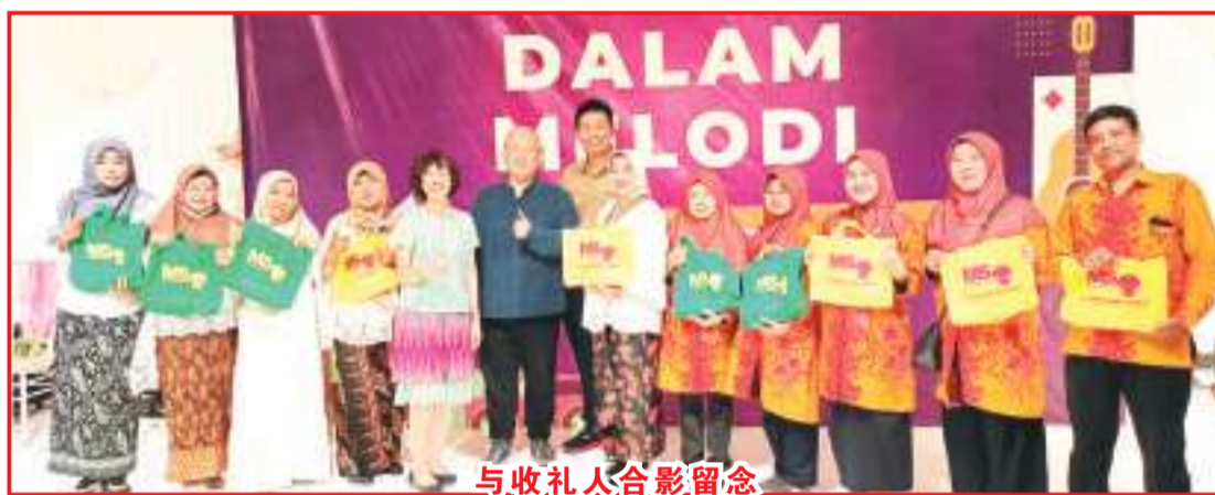
与收礼人合影留念