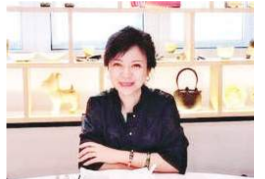
父亲就读于集美中学, 小时候, 我会很开心地跟随父亲去参加在校园里举行的新春团拜, 或者校庆

远处又传来老师召集上车的声音, 忽远忽近。耳边传来泉水叮咚响的音乐, 唤醒的闹钟总是能把人带回现实世界, 原来, 我又一次梦里神游故里, 魂牵梦绕的是那解不开的乡愁。