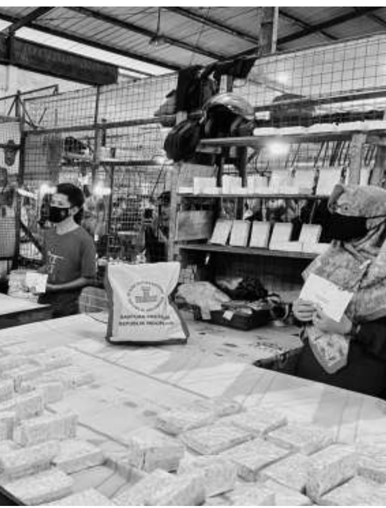
Cigombong 传统市场,对基本日用品的价格进行视察。

艾温说:“根据记录,今年11月份的外币活期存款同比增长了27.9%,比上一月或今年10月份增长14.3%更高。”