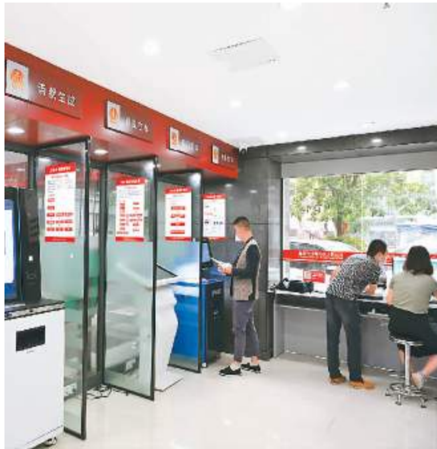
在重庆市沙坪坝区人民法院24小时自助诉讼厅，市民办理相关业务。

以往平均耗时15天的上诉案件卷宗移送工作，现在仅需几分钟即可完成；各类智能审判辅助系统减轻法官事务性工作30%以上，庭审效率提升20%以上……人民法院积极推进大数据、人工智能、区块链等现代科技在审判工作中的应用，助力法官寻找事