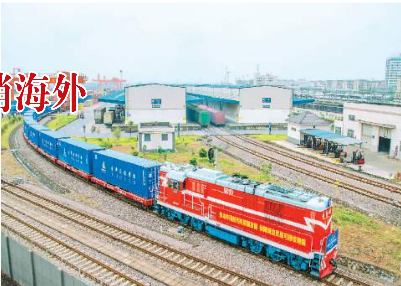
满载着100个标准箱取暖器、扫雪机及其他日用百货的列车从浙江省金华市出发，驶向万里之遥的欧洲。

浙江拥有外贸市场“嗅觉”灵敏的义乌和国内最大小家电出口城之一——慈溪。这波“暖经济”实际情况如何，跟着记者一起走进浙江探寻究竟。