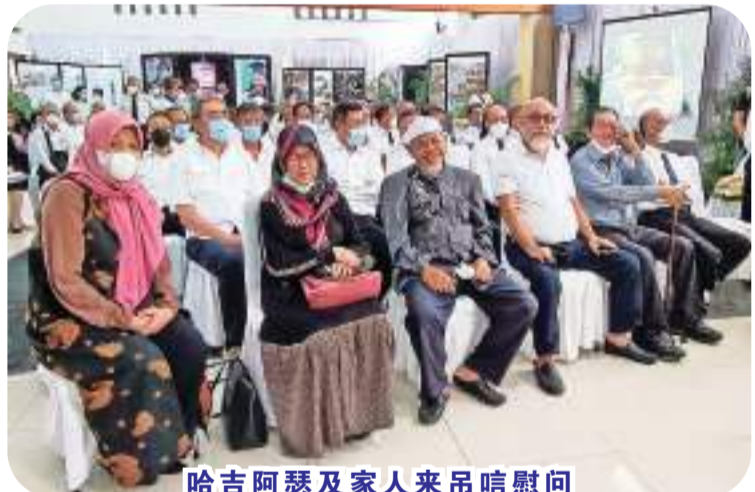
哈吉阿瑟及家人来吊唁慰问