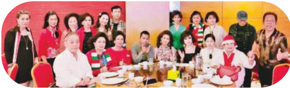
美妙歌声中传友情