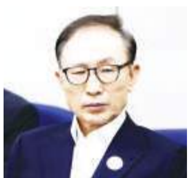
资料图：韩国前总统李明博