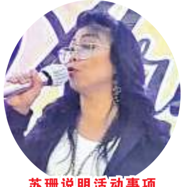
苏珊说明活动事项