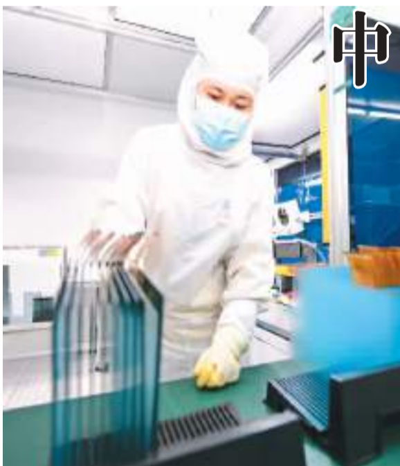
11月28日，江西省信丰县高新技术产业园区，工人在一家电子产品生产企业车间内加工出口触控显示屏。