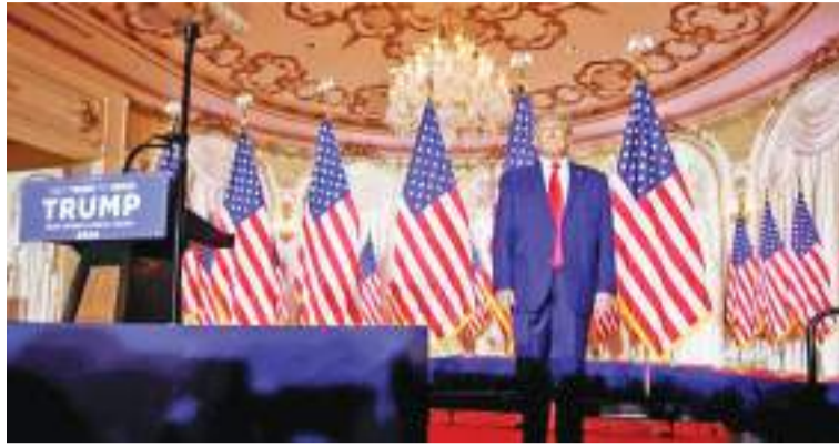
当地时间2022年11月15日，美国前总统特朗普在佛罗里达州海湖庄园发表演讲，正式宣布将参加2024年美国大选