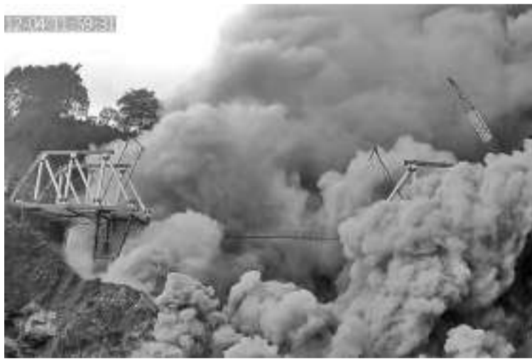
史默鲁火山喷发熔岩损坏了南海漳县两座桥梁