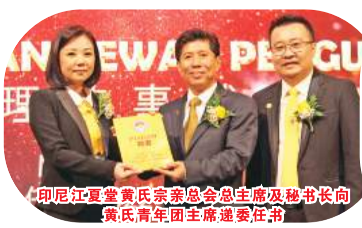
印尼江夏堂黄氏宗亲总会总主席及秘书长向黄氏青年团主席委任书