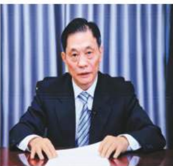
全國港澳研究會會長鄧中華於線上發表主題演講。