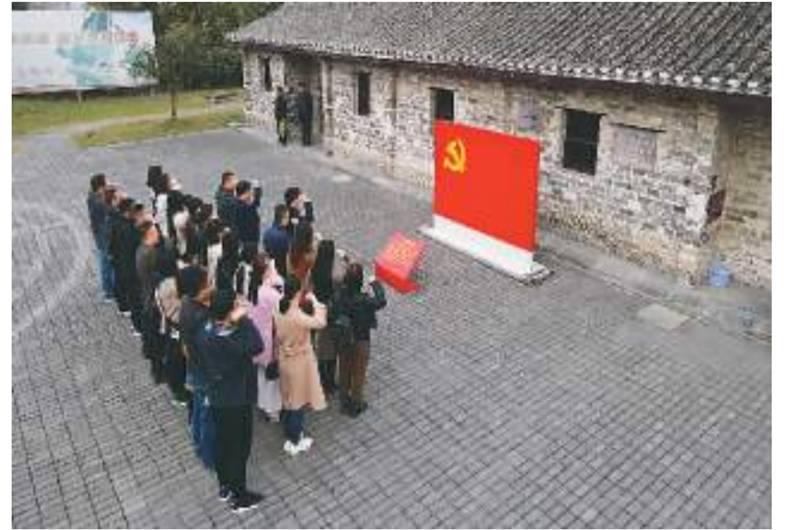
安徽省合肥市庐阳区杏林街道新一届社区党委班子成员和党员代表在红色教育基地党旗前重温入党誓词。

各地在推进以党建引领基层治理过程中有何经验？如何进一步提升和发挥党组织在基层治理中的战斗堡垒作用，推进基层治理现代化？请看本报记者采访。