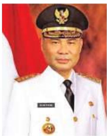
东努省省长维克多