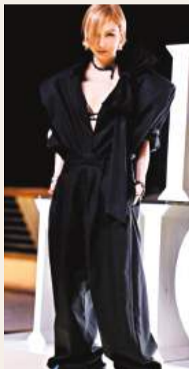
◆Sammi表示因遇上幾個好電影劇本，因此開演唱會前會先拍電影。