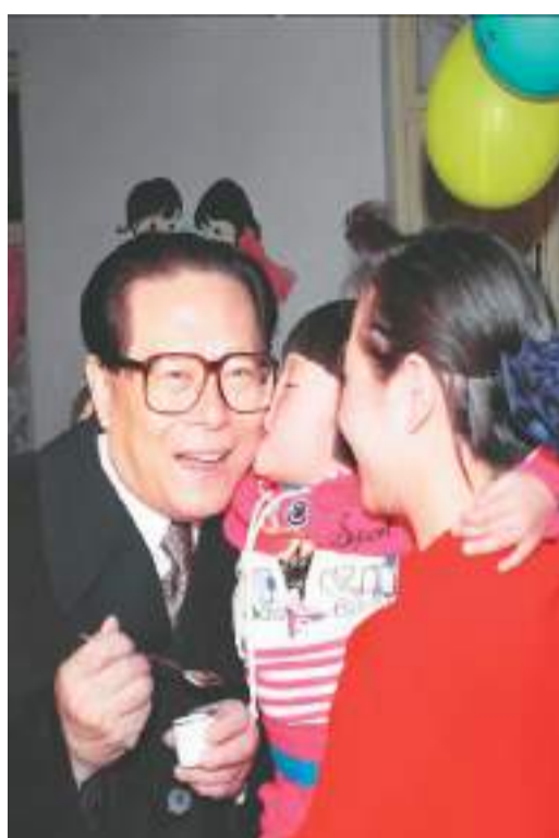
右图：1993年12月5日，江泽民同志在北京为一位幼儿园儿童喂服脊髓灰质炎疫苗后，小朋友亲吻江爷爷。