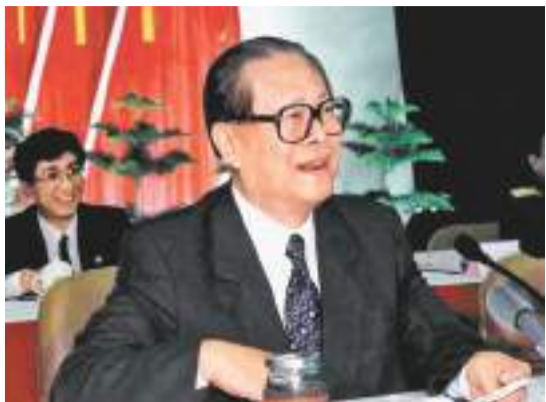
2000年2月20日，江澤民同志在廣東省高州市領導幹部「三講」教育會議上發表重要講話。在這次廣東考察中，江澤民同志提出，我們黨總是代表着中國先進生產力的發展要求，代表着中國先進文化的前進方向，代表着中國最廣大人民的根本利益。