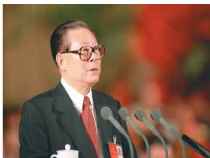
上图：1997年9月12日，中国共产党第十五次全国代表大会在北京人民大会堂开幕。这是江泽民同志代表第十四届中央委员会作报告。