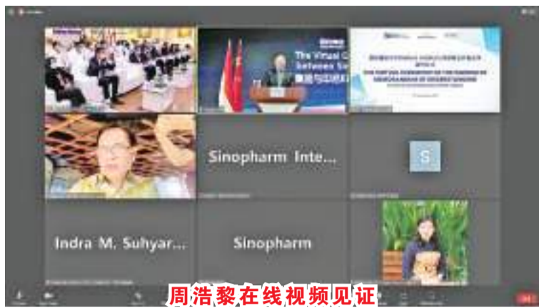
周浩黎在线视频见证