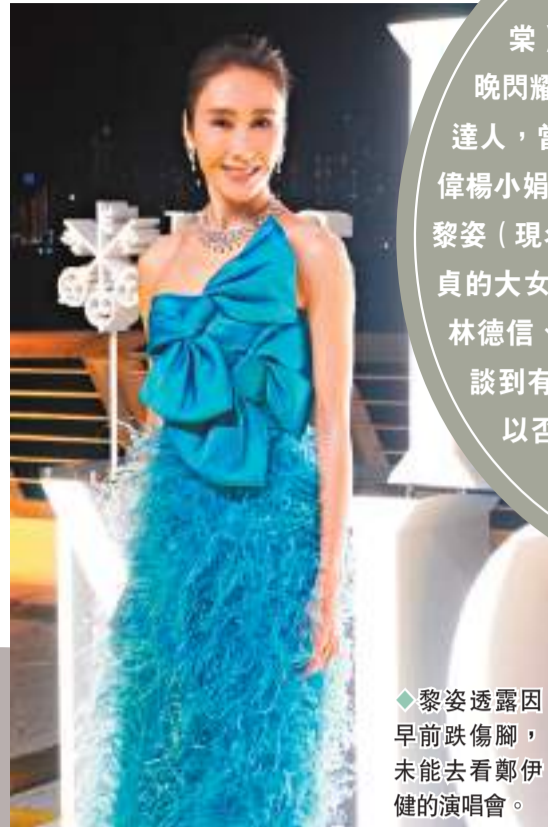
◆黎姿透露因早前跌傷腳，未能去看鄭伊健的演唱會。