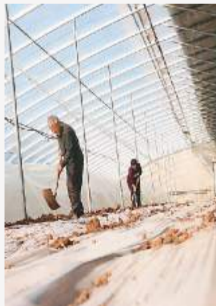
河南省洛阳市汝阳县柏树乡通过实施“党支部+合作社+农户”经营模式，发展红薯产业。图为枣林村集体股份合作社大棚红薯育苗基地，薯农在给薯苗温棚覆土。