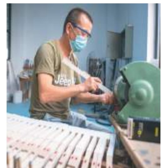
钢琴制造业是浙江省湖州市德清县洛舍镇的特色产业之一。因为工人在洛舍镇一钢琴制造企业内打磨钢琴琴键。