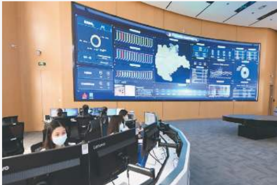
在北京市大兴区城市管理指挥中心，接诉即办座席员正在办公。