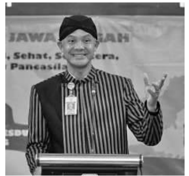
中爪哇省长甘贾尔

【本报讯】中爪哇省长甘贾尔赢得了Charta Politika Survey调查机构发布的总统候选人的可选性调查,这名印尼斗争民主党政党的可选性突破了30%大关。