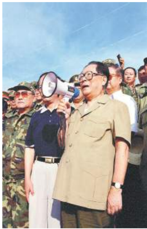
1998年8月13日至14日，江澤民同志親赴湖北長江抗洪搶險第一線，看望、慰問、鼓勵奮戰在抗洪搶險第一線的廣大軍民，指導抗洪搶險鬥爭。這是8月13日江澤民同志在洪湖市烏林鎮中沙角險段大堤上，向正在抗洪搶險的軍民發表講話。