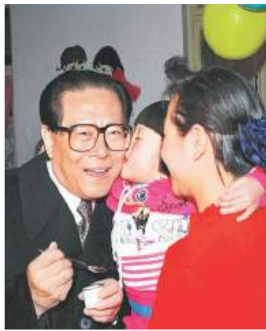
1993年12月5日，江澤民同志在北京為一位幼兒園兒童喂服脊髓灰質炎疫苗後，小朋友親吻江澤民。