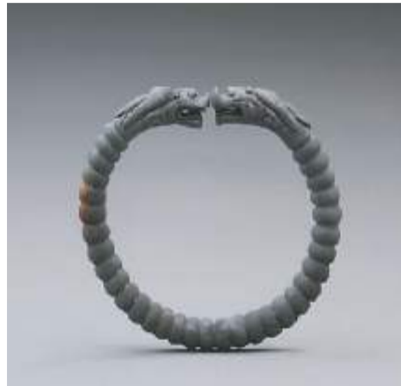
江口明末战场遗址出水的银手镯。

在出水文物中，还发现有张献忠用于册封妃嫔的金册，这对于探讨张献忠大西政权的相关政治制度以及“江口沉银”的历史背景有着重要意义。