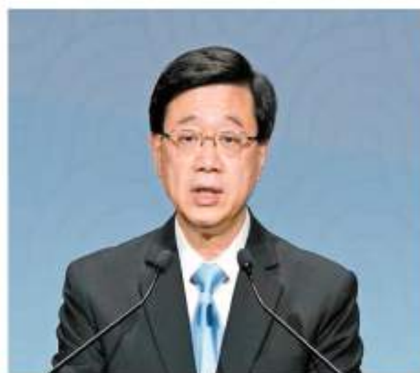
行政長官李家超致辭。