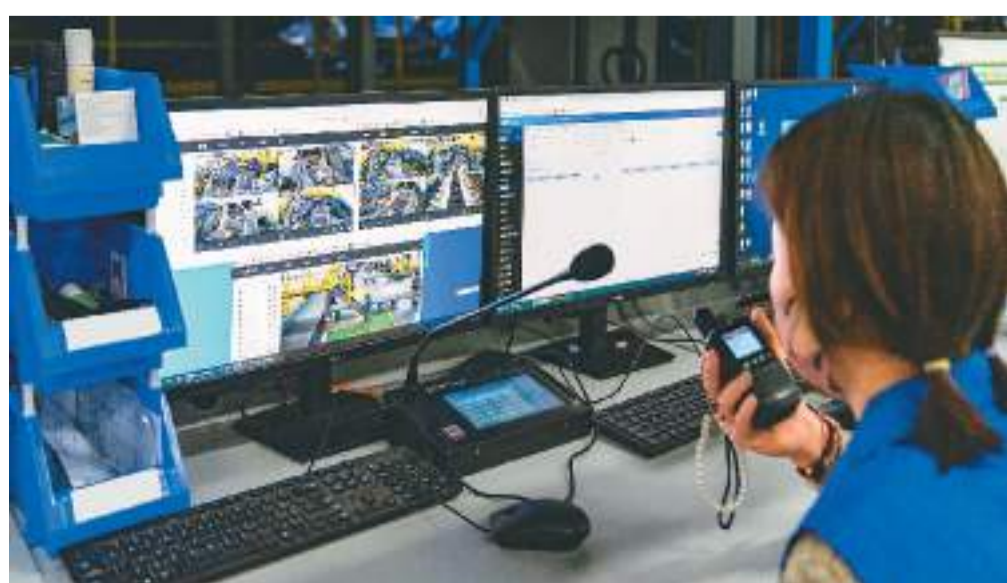
安徽省合肥市肥东县龙塘工业园一快递企业内，工人在全自动化分拣机控制系统前忙碌。

在传感器及识别、大数据、人工智能、地理信息系统等多项先进技术的支撑下，智慧物流给物流行业 and 人们的生活带来了很大改变。对消费者来说，人们不仅能享受更快捷、高质量的物流服务，还能不断提升绿色健康的消费和生活理念。