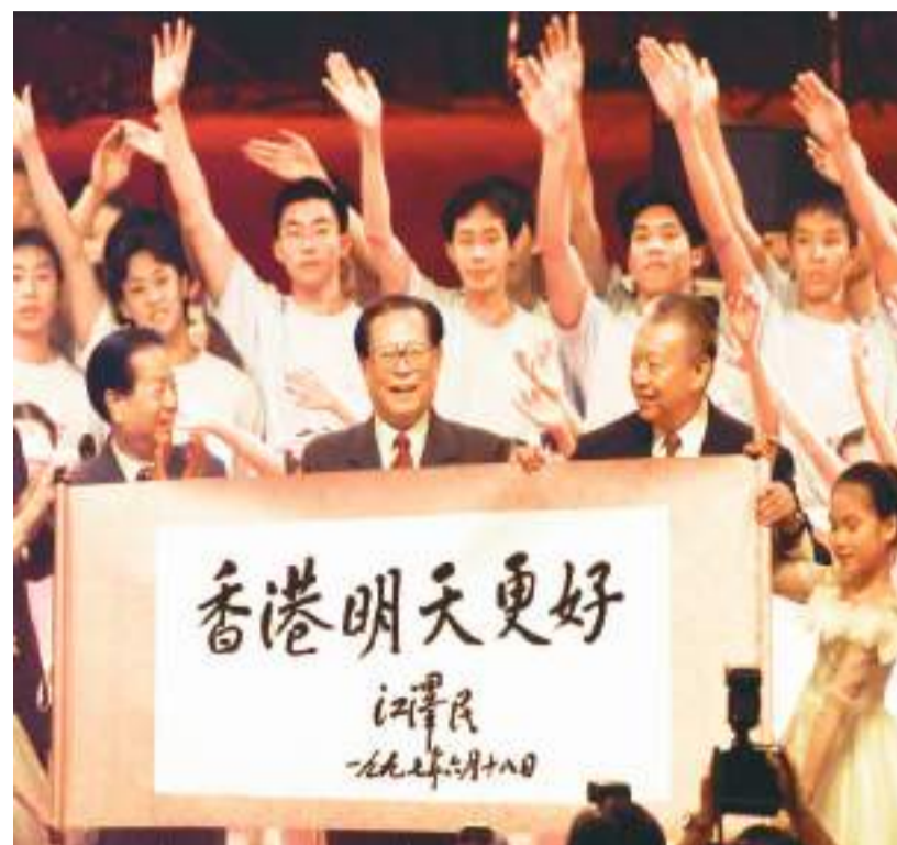
右图：一九九七年七月一日上午十时，香港特别行政区成立庆典在香港会展中心新翼举行。在庆典仪式上展示了江泽民同志亲笔题写的《香港明天更好》书法卷轴。