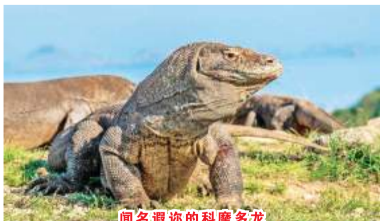
闻名遐迩的科摩多龙