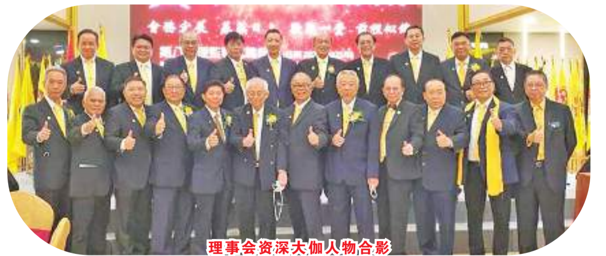
理事会资深大加人物合影