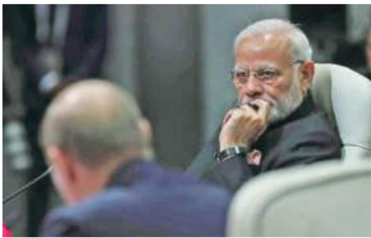
资料图：印度总理莫迪。

莫迪任职期间，古吉拉特邦吸引了不少投资。人民党在古吉拉特邦的宣传也一直基于其经济成绩，其口号是“我们造就了这个古吉拉特邦”。在近日的一场集会上，莫迪敦促选民“为一个发达和繁荣的古吉拉特邦和印度做