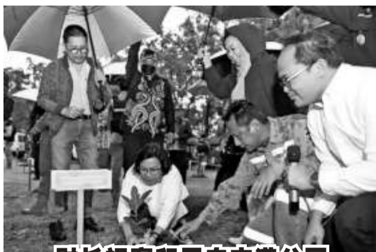
财长视察印尼自由港公司

据了解,徐比东房屋已被拟定为12个沿海旅游目的地之一,希望能招徕国内外游客前来观光。然而徐比东房屋周围没有停车场,因此游客可以在由当地居民安排的空地上停车,或可乘搭公共交通工具。(Ing)