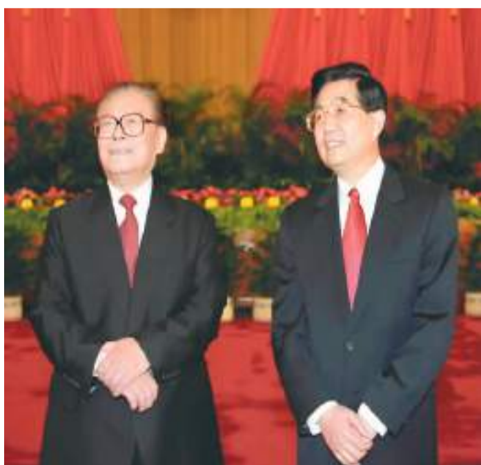
左图：2002年11月15日，江泽民同志、胡锦涛同志在北京人民大会堂亲切会见出席党的十六大代表、特邀代表和列席人员并发表重要讲话。