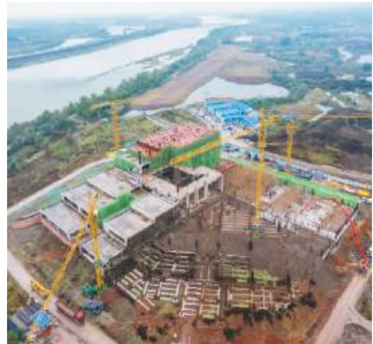
2022年10月，四川省眉山市彭山区岷江、府河交汇处，江口沉银博物馆项目正在施工。

据悉，彭山区还将实施“遗址”提档升级行动，将江口沉银博物馆建设成为集文物保护、文化传承创新于一体的博物馆，推动江口明末古战场遗址和武阳故城遗址申报国家级文物保护单位，形成高等级“大遗址”矩阵。