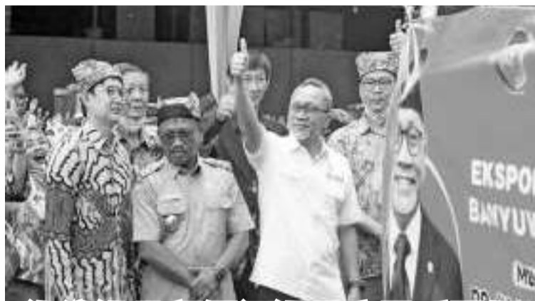
海洋渔业部保证渔业产品质量好

此前,内政部长表示,由于涉嫌在苏富比礼宾拍卖网站上拍卖Widi群岛,北马鲁古省政府将冻结LII公司的营业许可证。(Irw)