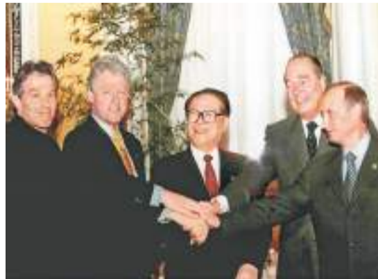
2000年9月7日，由中國倡議的聯合國安理會五個常任理事國首腦會議在紐約舉行。江澤民同志（中）同法國總統希拉克（右二）、俄羅斯總統普京（右一）、英國首相布萊爾（左一）、美國總統克林頓（左二）握手合影。