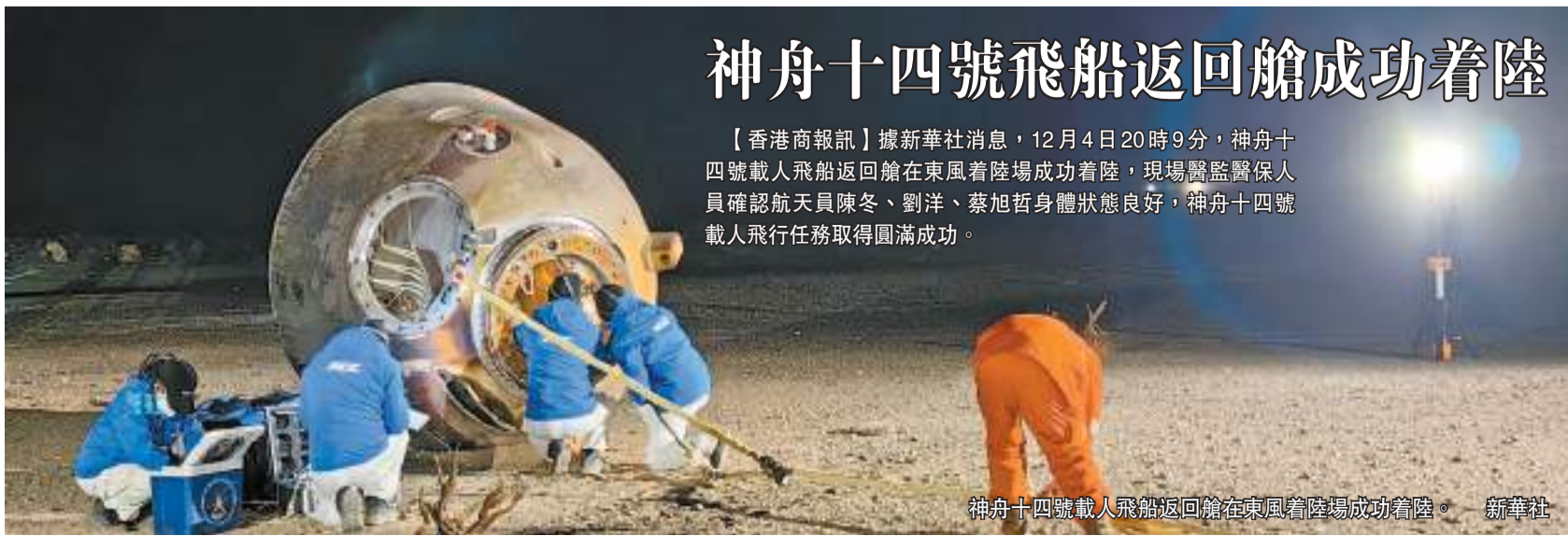
神舟十四號載人飛船返回艙在東風着陸場成功著陸。

【香港商報訊】據新華社消息，12月4日20時9分，神舟十四號載人飛船返回艙在東風着陸場成功著陸，現場醫監醫保人員確認航天员陳冬、劉洋、蔡旭哲身體狀態良好，神舟十四號載人飛行任務取得圓滿成功。