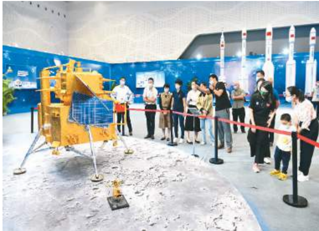
11月25日，“航天放飞中国梦”2022中国航天大会科普展在海南省海口市开展。图为观众在观看嫦娥五号探测器模型。

神舟十五号航天员乘组与神舟十四号航天员乘组在太空胜利“会师”；卡塔尔世界杯，“中国制造”的体育场馆设施科技感十足；中国创新者2021年提交的专利申请数量位居全球第一；2021年全球主要产品和服务中，中国企业13个品类高科技产品中的市场份额扩大……最近，中国高科技领域捷报频传，在全球高科技领域存在感不断增强，引发国际社会广泛关注。