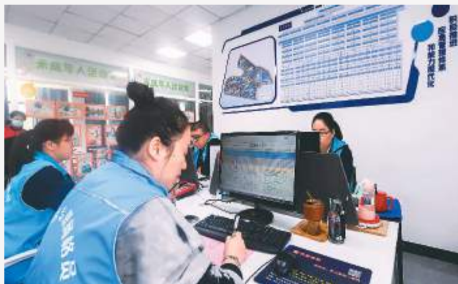
在浙江省湖州市吴兴区飞英街道余家漾社区党群服务中心，网格员对发现的安全隐患上报处理。