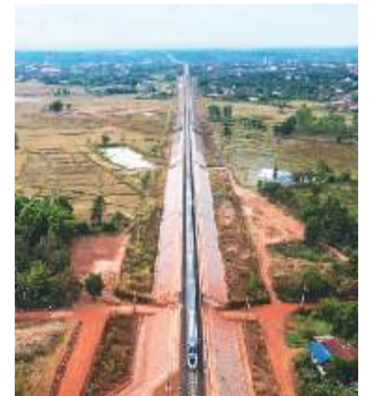
11月25日的航拍照片显示，“澜沧号”动车组行驶在老挝万象郊外的中老铁路老段上。