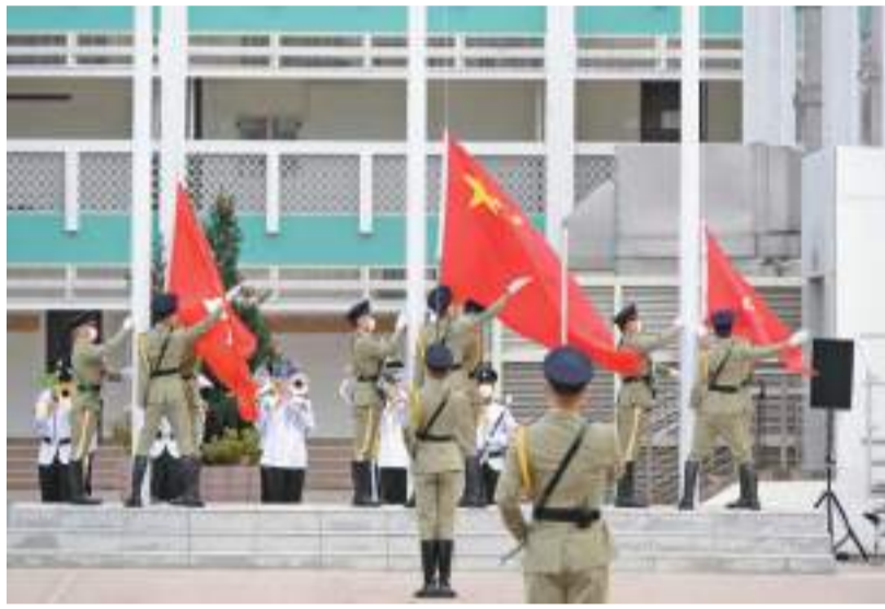
保安局昨日舉行憲法四十周年升旗儀式。

另外，為加強青少年對憲法的認識，保安局同場設立憲法教育區供嘉賓及出席活動的青少年參觀，並舉辦「我眼中的國家憲法日」攝影比賽，讓青少年發揮無限創意，利用鏡頭及網上平台表達他們在「國家憲法日」的所見所感，以提升其國民意識及對國家的認