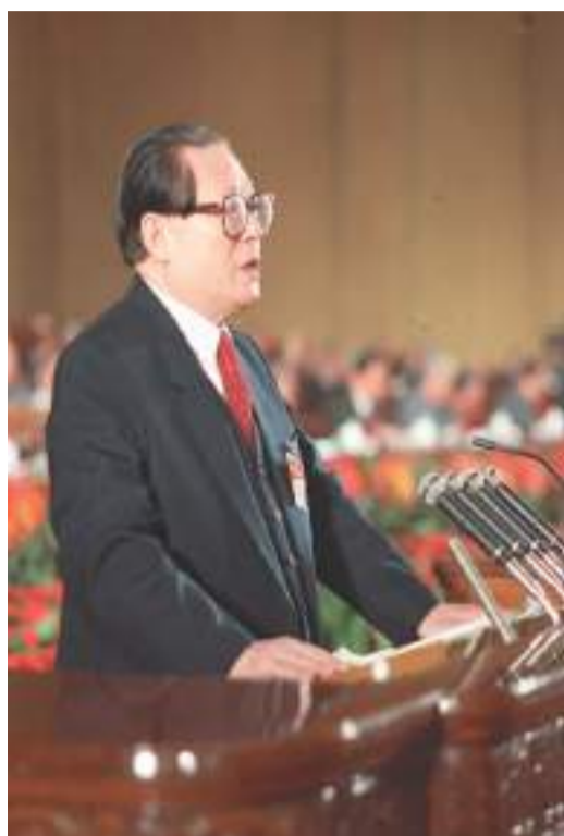
左图：1992年10月12日，中国共产党第十四次全国代表大会在北京人民大会堂开幕。这是江泽民同志代表第十三届中央委员会作报告。