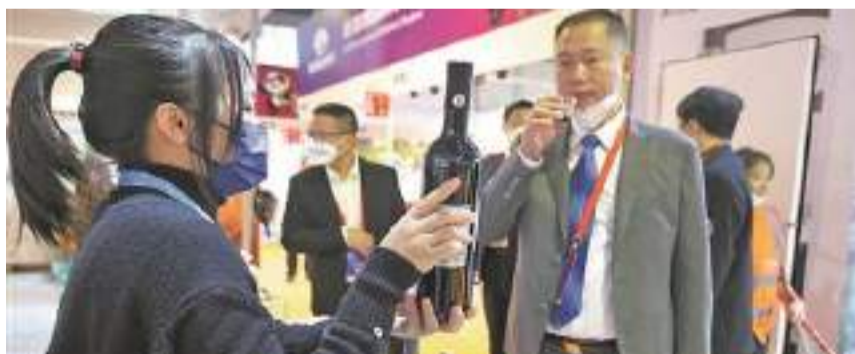
客商與參展商熱情交流

泉州網訊(記者溫文清 通訊員薛宇翔 文/圖)11月27日下午，第八屆中國(泉州)海上絲綢之路國際品牌博覽會暨第二屆RCEP青年僑商創新創業峰會在泉州石獅圓滿落幕。大會通過整合“海絲”品博會和“RCEP青年僑商峰會”的資源，實現了“1+1>2”效應，做大做強海絲品牌和僑務經貿平臺，打造國內外有影響力的涉僑經貿活動品牌。