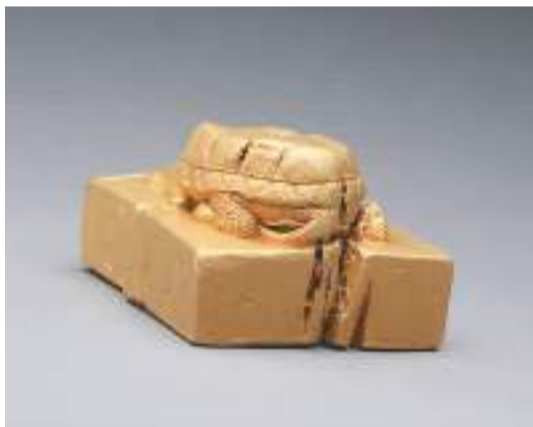
江口明末战场遗址出水的“蜀世子宝”金印。