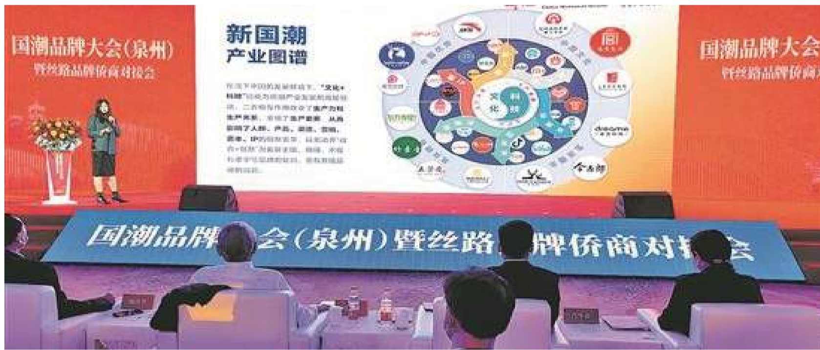
嘉賓分析國潮品牌發展趨勢

品牌是企業發展的永恒主題，也是推動企業發展的最高生產力。26日上午，由中國品牌建設促進會、絲路規劃研究中心主辦的“國潮品牌大會(泉州)暨絲路品牌僑商對接會”在石獅舉辦，活動旨在探索“國潮品牌”對經濟和新消費的推動作用，探討“國潮品牌”的國際化路徑，為城市發展注入新動力，為經濟發展打造新增長點。