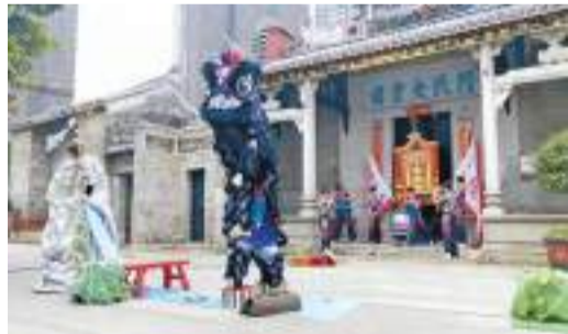
參賽醒獅隊在老村的祠堂裏拉開架勢。

【香港商報訊】記者黃裕勇報導：第六屆廣州市青少年醒獅表演賽近日舉行線上總決賽，來自台灣區趙家獅鼓樂龍獅團、花都區理工職業技術學校醒獅隊、白雲區省機龍獅團摘單獅組金獎，香港洪派國術總會少獅隊、澳門美高梅金獅體育會等隊伍榮獲特選表演金獎。 據悉，廣州已經連續6年舉辦青少年醒獅表演賽，吸引大灣區城市百餘支醒獅隊伍報名參賽。來自香港和澳門，以及由在穗港澳生組成的五支獅隊也在線上作為特邀嘉賓參與，粵港澳大灣區的「醒獅少年」們藉助這個平台，弘傳統、展新姿、促交流。 此次進入決賽圈的單獅組隊伍有12支，群獅組11支。決賽隊伍涵蓋廣州11個區，參加此次大賽的選手，既有高中生，也有三年級的小學弟，展現出廣州醒獅青少年傳承在全市範圍內「枝繁葉茂」的喜人態勢。