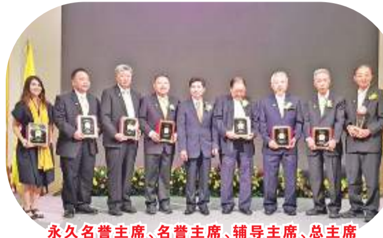
永久名誉主席、名誉主席、辅导主席、总主席