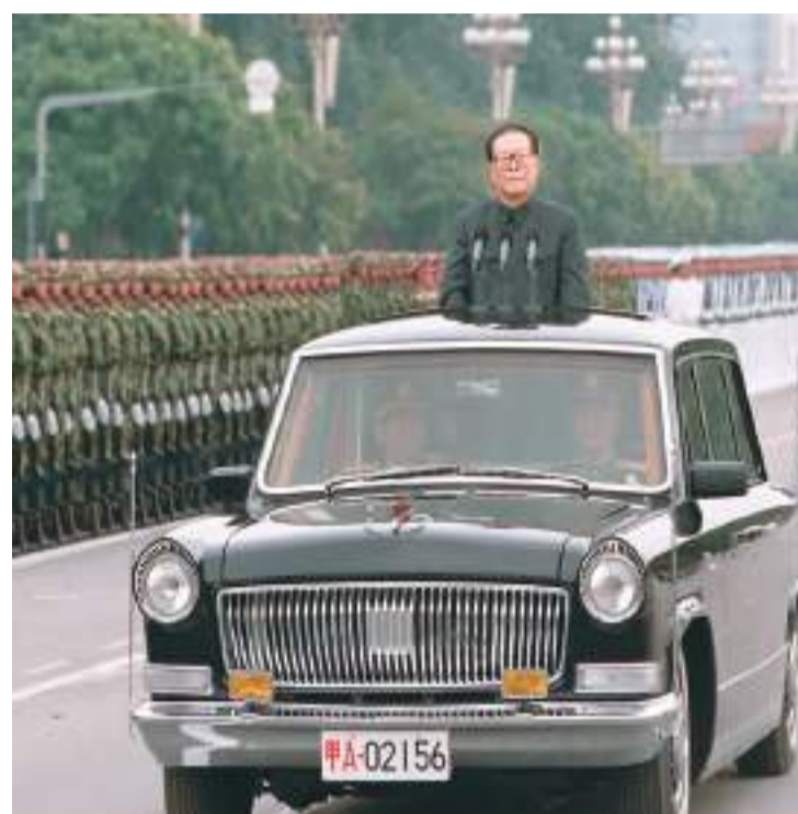
左图：一九九九年十月一日，中华人民共和国成立五十周年盛大庆典在北京天安门广场举行。江泽民同志检阅由人民解放军陆军航空三军和人民武装警察部队、民兵预备役部队组成的地面方队。