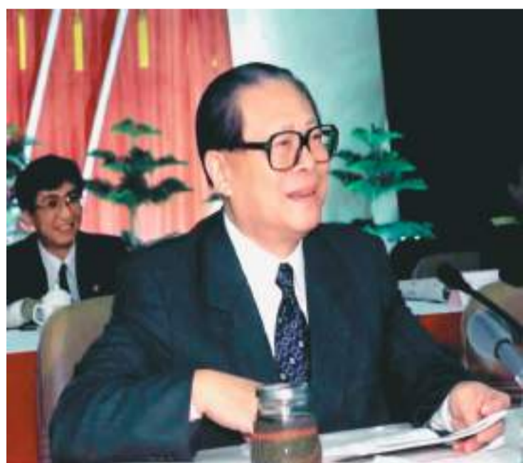
上图：2000年2月20日，江泽民同志在广东省高州市领导干部“三讲”教育会议上发表重要讲话。在这次广东考察中，江泽民同志提出，我们党总是代表着中国先进生产力的发展要求，代表着中国先进文化的前进方向，代表着中国最广大人民的根本利益。