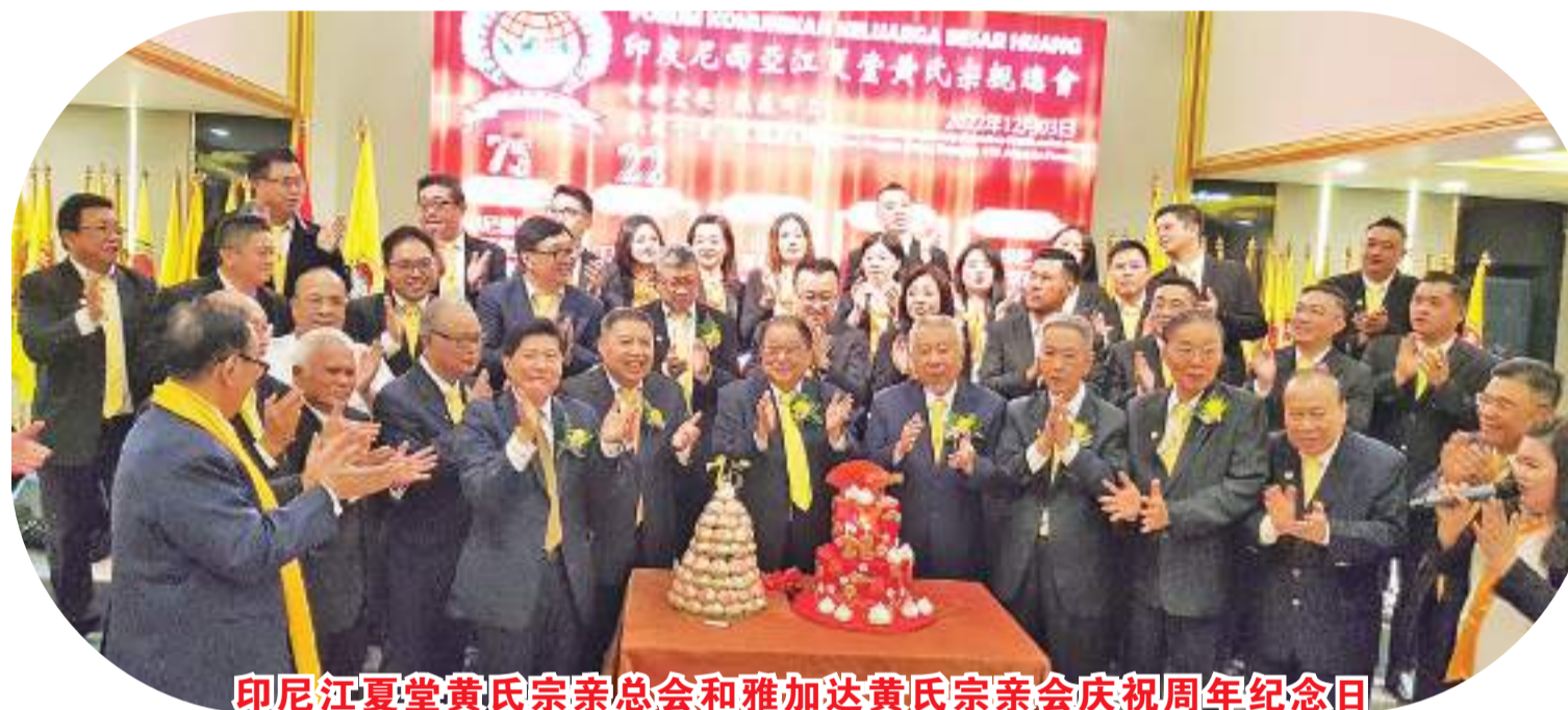
印尼江夏堂黄氏宗亲总会和雅加达黄氏宗亲会庆祝周年纪念日