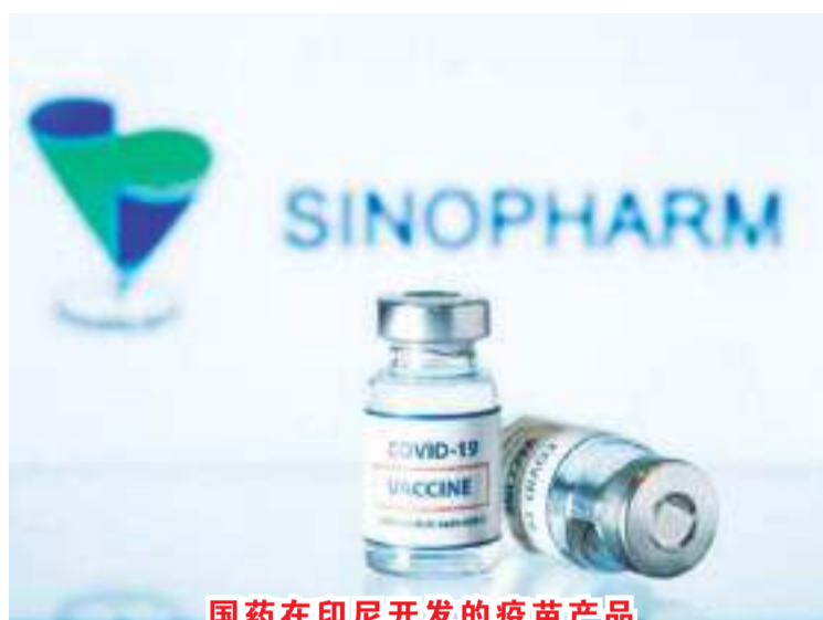
国药在印尼开发的疫苗产品

相互合作和产品开发上的战略合作备忘录。在不久前刚成功闭幕的G20峰会上，印尼将健康卫生