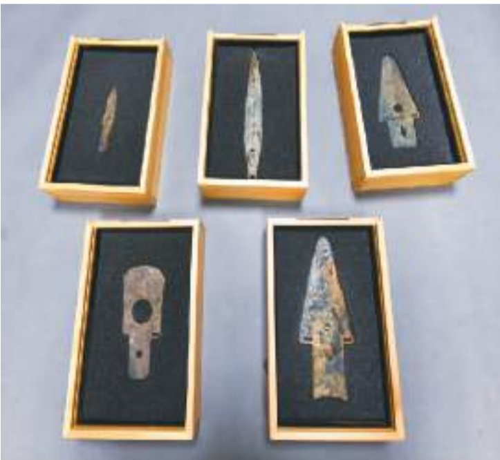
江口明末战场遗址发现的青铜兵器。