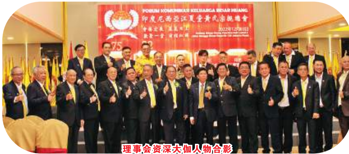
理事会资深大加人物合影