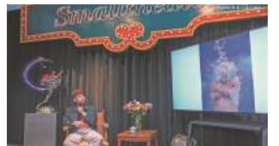
陳文令給現場觀眾帶來一場魔幻現實主義分享會

據介紹，“2022世遺泉州時尚文化藝術季”公共文化藝術公益惠民系列活動，是以閩南傳統文化、海洋文化、山地文化和戲曲文化爲核心元素開展的藝術活動。未來，該系列活動還將繼續邀請國際知名當代藝術家、創作者、知名攝影家參加。