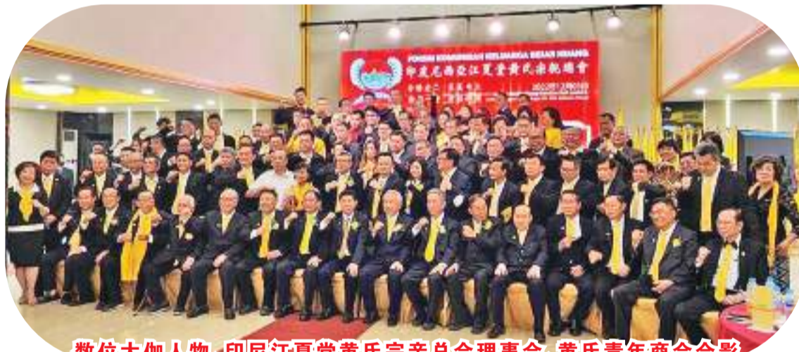
数位大加人物、印尼江夏堂黄氏宗亲总会理事会、黄氏青年商会合影