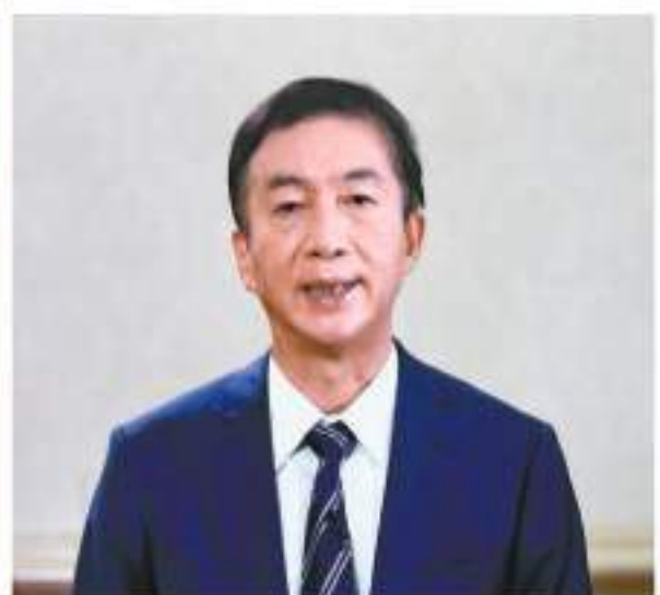
中聯辦主任駱惠寧以視像形式致辭。