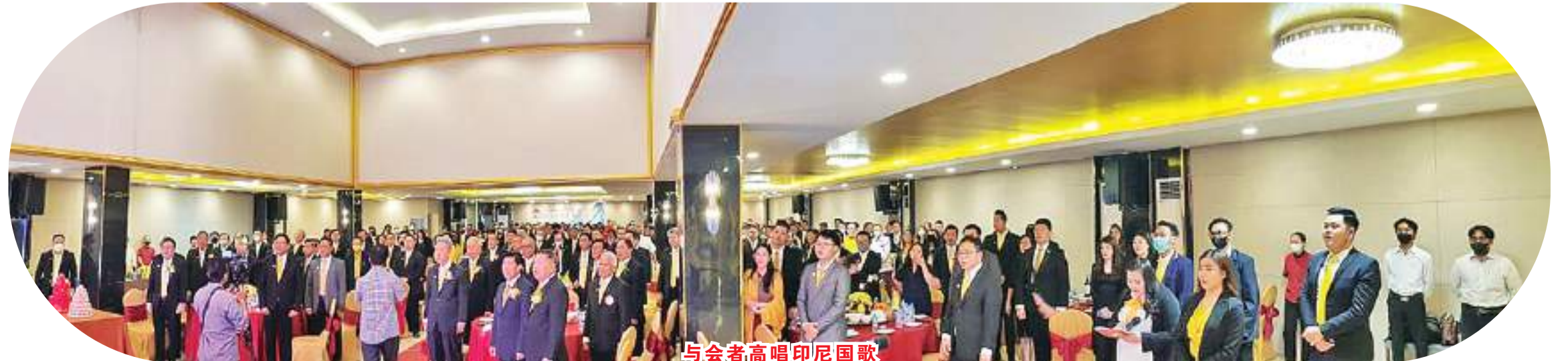
与会者高唱印尼国歌