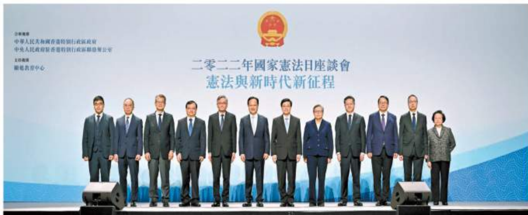
昨天，特區政府聯同中聯辦合辦2022年「國家憲法日」座談會，行政長官李家超（右六）、中聯辦副主任陳冬（左六）等嘉賓出席。