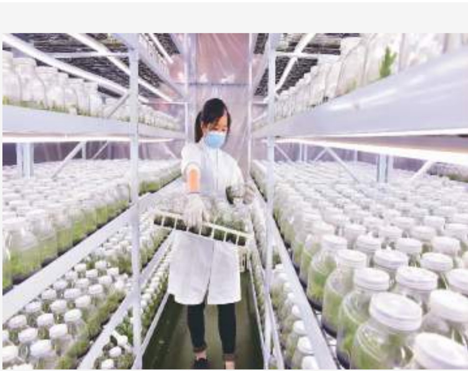
近日，贵州省从江县贯洞镇铁皮石斛育苗基地工作人员抢抓农时，开展石斛育苗工作，为来年春耕做准备。近年来，从江县抓好种子研究、科学育苗、技术选育等关键环节，选育优质石斛品种，实现稳产增产。

光伏产品出口量价齐升。1至10月份，光伏产品（硅片、电池片、组件）出口总额超过440亿美元，同比增长90.3%，创历史新高。中国光伏行业协会名誉理事长王勃华介绍，欧洲市场对光伏的需求攀升，组件出口到欧洲市场的份额超过一半；南美市场中巴西对光伏的需求旺盛。