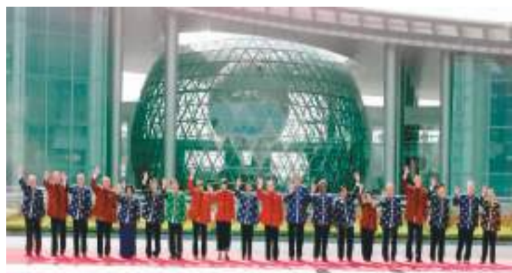
上图：2001年10月21日，亚太经合组织第九次领导人非正式会议在上海举行。这是江泽民同志与参会的经济体领导人合影。