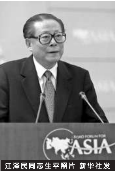
江泽民同志生平照片