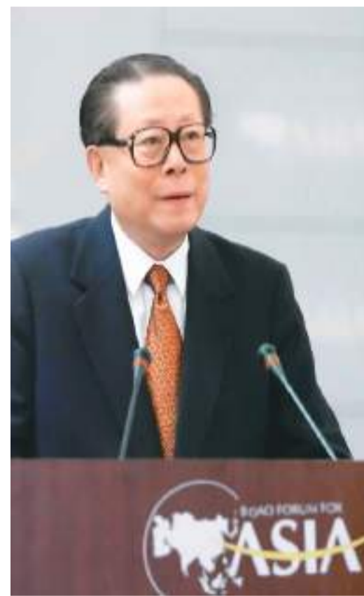
上图：2001年2月27日，博鳌亚洲论坛成立大会在海南举行。江泽民同志出席成立大会并致辞。