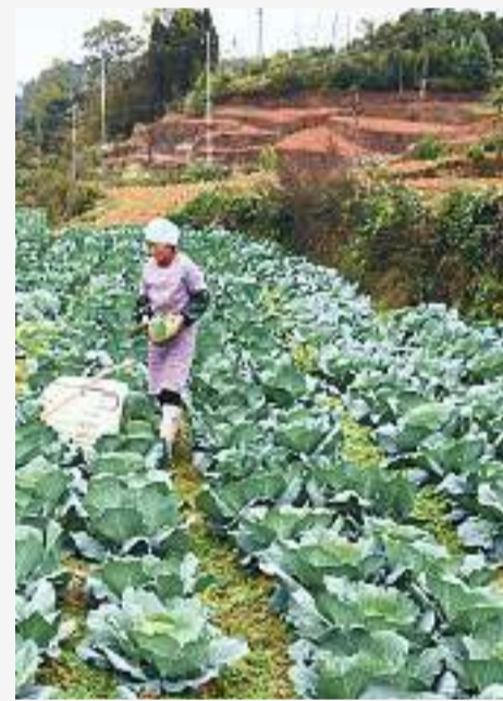
贵州省黔东南苗族侗族自治州麻江县强化党建引领，大力发展蔬菜种植。图为村民在龙山镇共和村坝区采收莲花白。