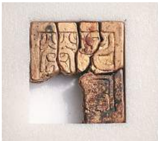
江口明末战场遗址出水的“荣世子宝”金印局部。