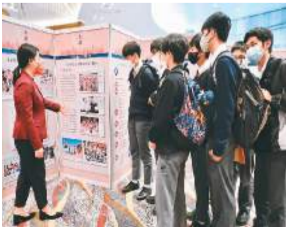
因为学生参观图片展。

本报香港12月10日电(记者陈然)“九二共识”30周年图片展开幕式近日在香港会展中心举行。全国政协副主席梁振英,中共中央台办、国务院台办主任刘结一通过视频致辞,香港特区政府政务司司长陈国基、中央政府驻港联络办副主任陈冬等担任主礼嘉宾。香港特区政府有关