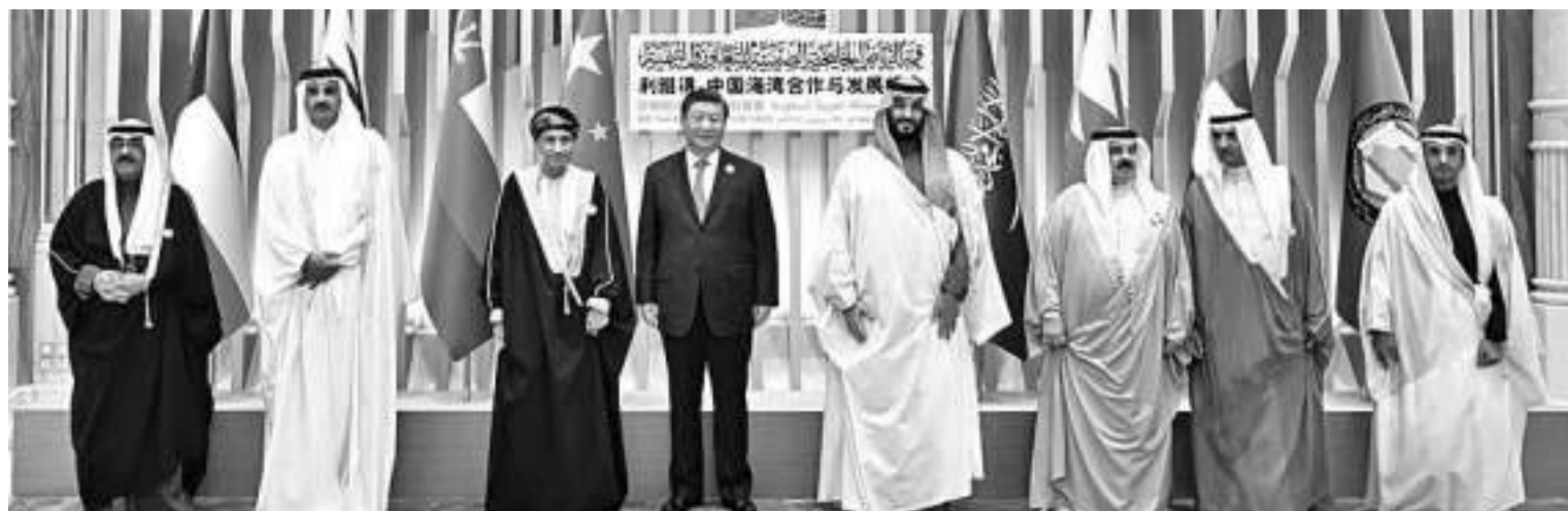
当地时间12月9日下午,首届中国—海湾阿拉伯国家合作委员会峰会在利雅得阿卜杜勒阿齐兹国王国际会议中心举行。中国国家主席习近平和沙特王储兼首相穆罕默德、卡塔尔埃米尔塔米姆、巴林国王哈马德、科威特王储米沙勒、阿曼副首相法赫德、阿联酋富查伊拉酋长沙尔基、海合会秘书长纳伊夫出席峰会。

习近平在主旨讲话中这样总结源远流长的中阿友好交往凝聚成的中阿友好精神:“守望相助、平等互利、包容互鉴”。他指出,守望相助是中阿友好的鲜明特征,平等互利是中阿友好的不竭动力,包容互鉴是中阿友好的价值取向。