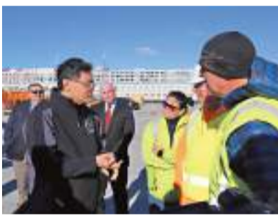
◆當地時間12月8日，秦剛大使到訪馬薩諸塞州波士頓港，與港務局、國際碼頭工人協會負責人深入交流，實地考察港口運營並與碼頭工人親切互動。

同日，秦剛在芝加哥舉行的美國中國總商會芝加哥分會年會晚宴上發表主旨演講時表示，一些人將中國定義為「最主要競爭對