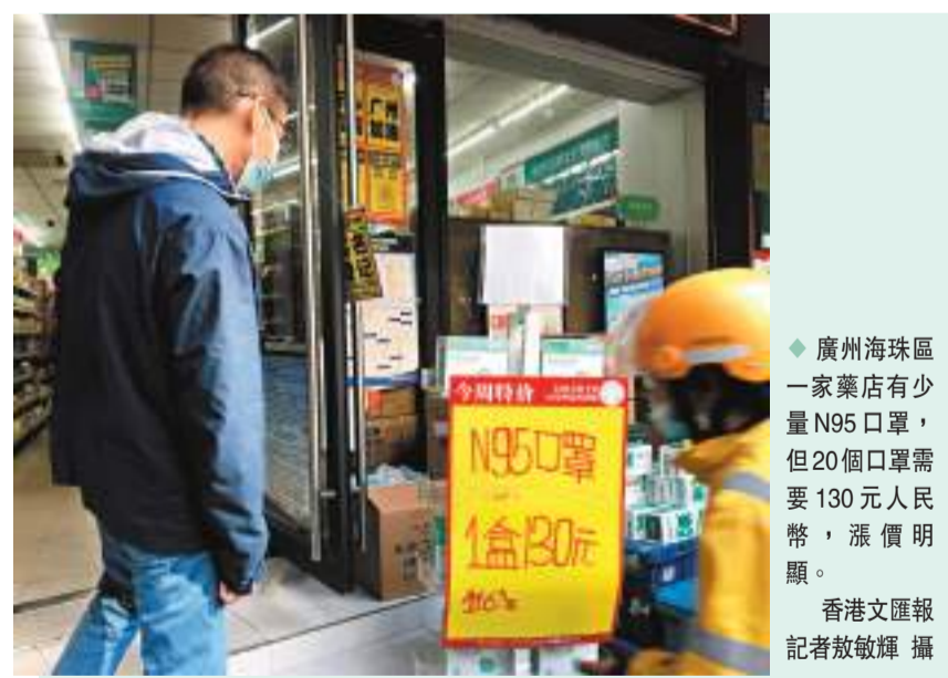
廣州海珠區一家藥店有少量N95口罩，但20個口罩需要130元人民幣，漲價明顯。

香港文匯報記者後來通過電商平台搜索抗原檢測產品和N95口罩，價格同樣上漲，下單時，均顯示「當前區域無庫存」。