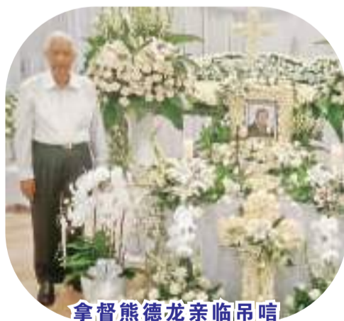
拿督熊德龙亲临吊唁