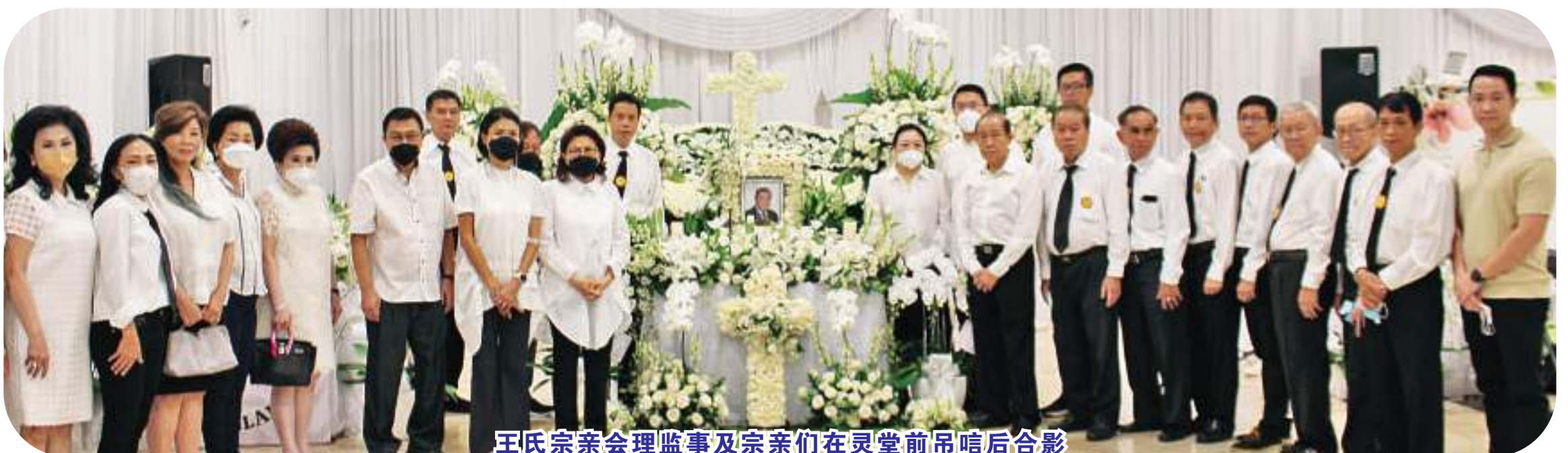
王氏宗亲会理监事及宗亲们在灵堂前吊唁后合影