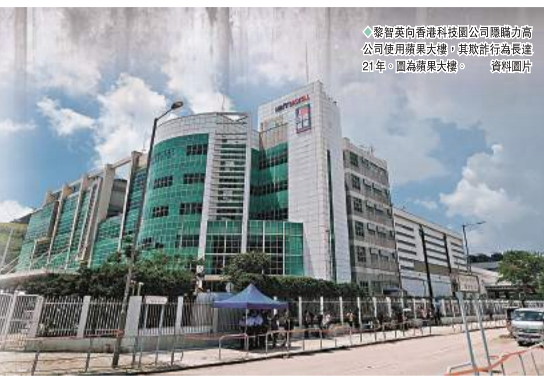
◆黎智英向香港科技園公司隱瞞力高顧問公司使用蘋果大樓，其欺詐行為長達21年。圖為蘋果大樓。

法官陳廣池10日在判刑時指出，黎智英在本案中面對的兩項欺詐罪，涉案時段由1998年4年至2020年5月，其欺詐行為長達21年，有如偷竊10年，就算總額相同，罪責亦較單次偷竊嚴重。