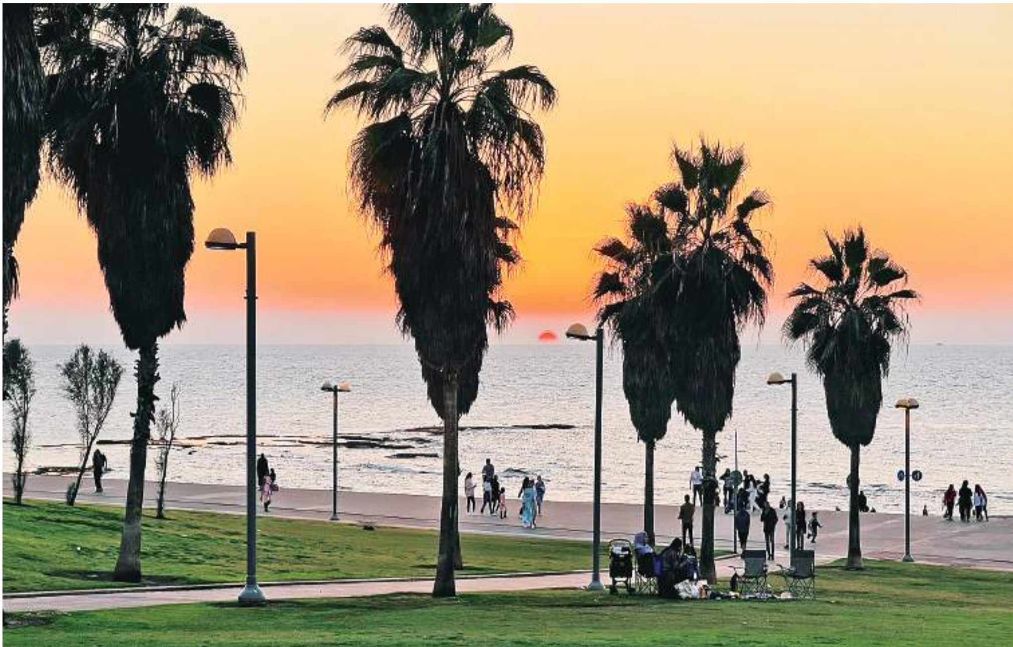
这是12月10日拍摄的以色列特拉维夫海边落日景色。

地址: GEDUNG GUOJIRIBAO, Jl. Gunung Sahari XI, Jakarta 10720, E-Mail: editor@guojiribao.com 電話: (62-21)626 5566(Hurting) 傳真(廣告部): 626 1866 (編輯部): 626 1366 (發行部): 626 1766