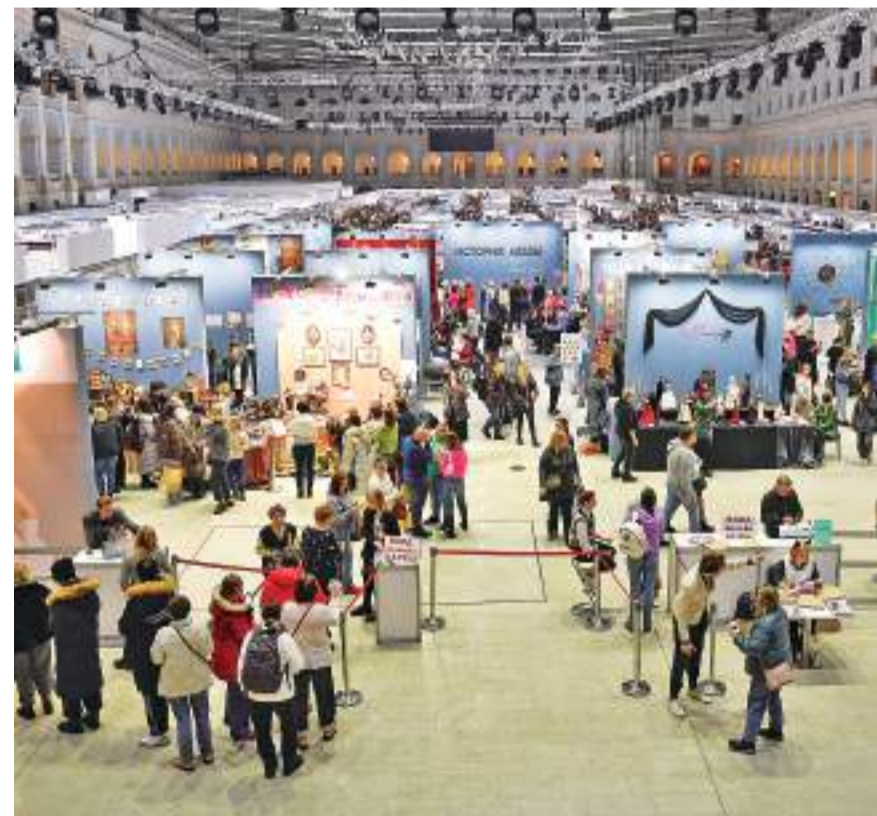
莫斯科学办玩偶艺术展 这是12月10日在俄罗斯莫斯科拍摄的玩偶艺术展现场。 近日,莫斯科学办玩偶艺术展,展出逾千名艺术家制作的各式玩偶作品。

12月10日是瑞典化学家和发明家诺贝尔的逝世纪念日,每年的诺贝尔奖颁奖典礼都安排在这一天举行。