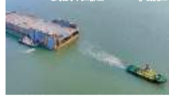
◆航拍E23管節鋼殼和最終接頭出運。中新社

香港文匯報訊（記者 方俊明 廣州報導）作為繼港珠澳大橋之後又一世界級「橋、島、隧、水下互通」為一體的超級群體工程，深中通道建設又獲新突破。記者10日從廣東省交通集團獲悉，世界首創的深中通道海底沉管隧道整體預製水下推出式最終接頭，及最後一節沉管（E23）鋼殼完成製造，深中通道海底沉管鋼殼製造工作全部完成，於同日出運至珠海桂山島沉管預製智慧工廠進行自密實混凝土澆築及舾裝等施工，計劃在2023年中進行浮運沉放。