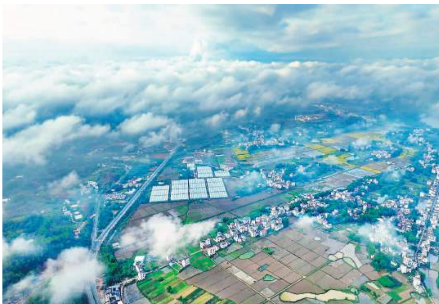
江西省赣州市信丰县的冬日村景。