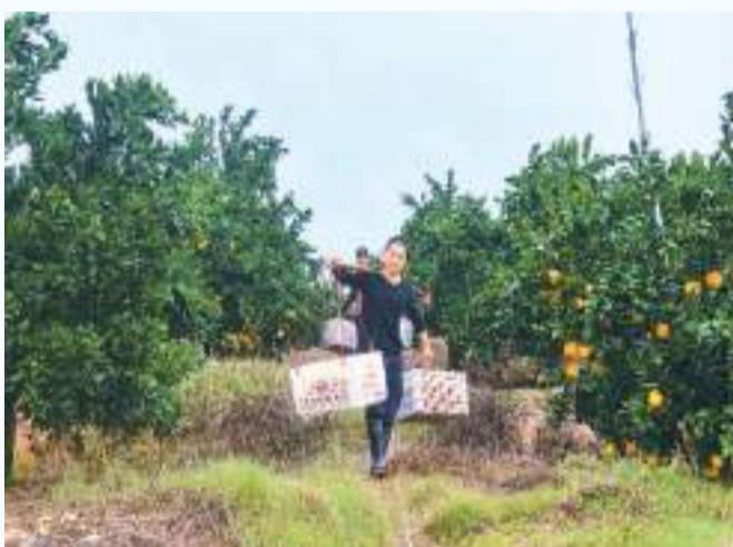
信丰县脐橙进入收获季。