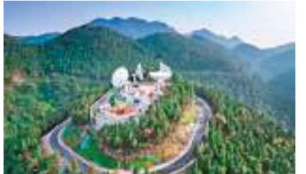
◆位於重慶兩江協同創新區明月山上的「中國複眼」。

上，由北理工重慶創新中心牽頭建設。目前，科研人員正在對4部16米口徑雷達進行最後的安裝調試。