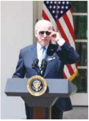
资料图:美国总统拜登。 中新社记者陈孟统摄 中新网12月11日电 综合报道,美国消费者新

闻与商业频道(CNBC)日前的一项调查发现,约70%的受访者不希望拜登竞选连任美国总统。与此同时,61%也不希望已宣布参选2024年总统大选的特朗普竞选。 据报道,按党派划分来看,57%的民主党人、66%的中间派选民和86%的共和党人不希望拜登竞选连任。 调查发现,认为拜登不应该参选的受访者中,47%指出年龄是主要原因,其中包括61%的民主党人。上个月满80岁的拜登,已是美国历史上最