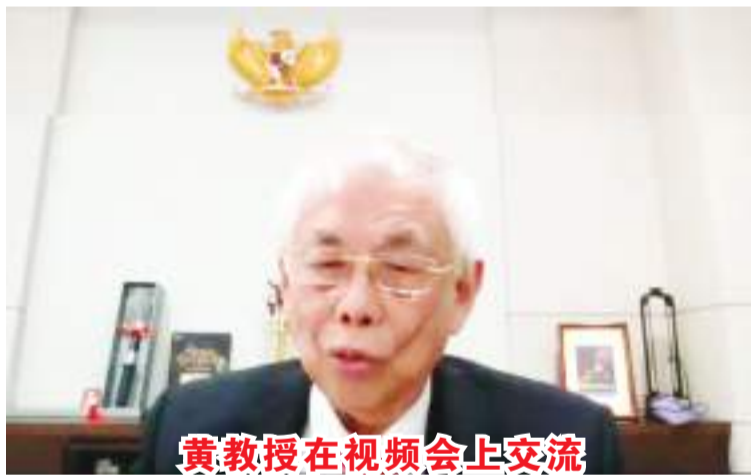
黄教授在视频会上交流

情,也希望华侨大学向外国留学生敞开大门。相信未来中国的经济会越来越强,这样教育的发展也会越来越强。第三,讲述神经外科的发展历史与展望。并相信通过这次的线上授课,学生受益良多。黄教授也举例了当今现代医药技术发达,通过扫描可准确地找到病因,及微创手术可给病人迅速复原,减轻痛苦。