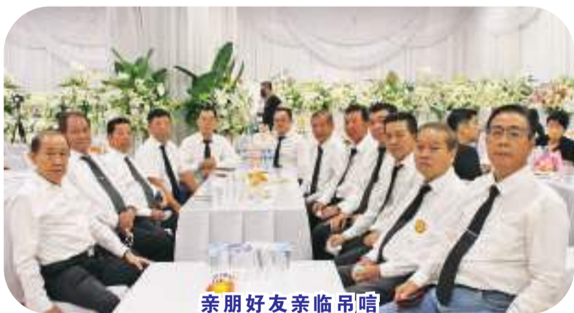
亲朋好友亲临吊唁