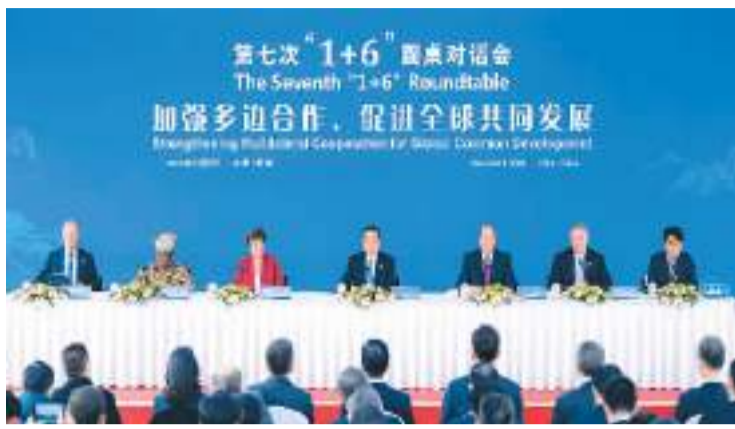
12月9日，国务院总理李克强在安徽省黄山市同世界银行行长马尔帕斯、国际货币基金组织总裁格奥尔基耶娃、世界贸易组织总干事伊维拉、经济合作与发展组织秘书长科勒曼、金融稳定理事会主席诺特和国际劳工组织总干事洪博的特别代表李昌徽在举行第七次“1+6”圆桌对话会后共同会见记者。

新华社合肥12月10日电（记者伍岳、曹嘉玥）国务院总理李克强12月9日在安徽省黄山市同世界银行行长马尔帕斯、国际货币基金组织总裁格奥尔基耶娃、世界贸易组织总干事伊维拉、经济合作与发展组织秘书长科勒曼、金融稳定理事会主席诺特和国际劳工组织总干事洪博的特别代表李昌徽在举行第七次“1+6”圆桌对话会后共同会见记者。