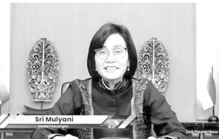
财政部长穆丽亚妮

统秘书处YT频道宣称,在2022年2月俄乌战争开始时,我国正在举行的20国集团(G20)央行行长会议。由于战争,论坛的讨论立即发生变化。现在,我们看到了,如果当时进行谈判,然后战争停止,也有可能,在2023年出现临界点。 穆丽亚妮指出,尽管经济状况可能在2023年有所改善,在食品和能源价格上涨的现象上,情况无法如此