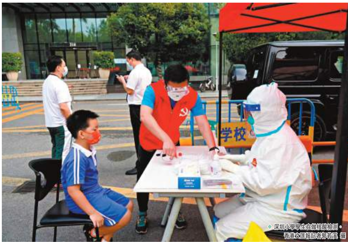
深圳小學學生在做核檢。

她的大兒子稱，以往每天下午上學後要佔用午休時間排隊測核檢，平均一個班要半小時以上才能做完，耽誤不少時間，以後取消核檢，能多了很多學習的時間，最重要的是校外培訓、興趣班都能重新開課了，而自己則會更加