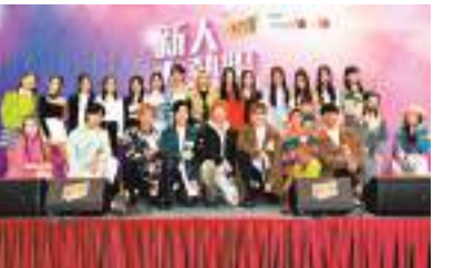
◆一眾樂壇新人10日參與《新人大熱唱2022》活動。