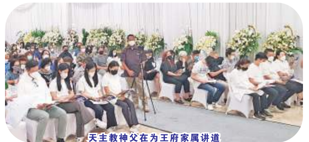
天主教神父在为王府家属讲道