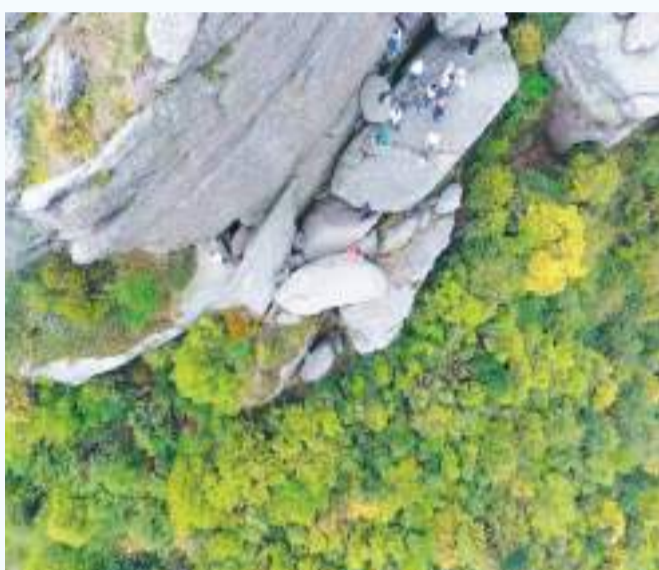
游人行走在木公寨。

西风初作十分凉，喜见新橙透甲香。信丰是著名的“中国脐橙之乡”，素有“世界橙乡”美誉。时下，在木公寨山麓下丘陵地带，万亩脐橙密密匝匝地由山脚至山顶排列开去，枝繁叶茂，长势旺盛，在阳光下，悬挂在枝头的明黄橙子闪着油亮的光泽，像一盏盏闪亮的黄灯笼，照