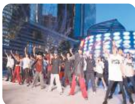
游客与市民一起跳舞。

嘻哈舞、技巧舞、机械舞、爵士舞，各种舞蹈在浙江省台州市椒江区腾达中心广场花式上演，台上的演员随着强劲的乐曲起舞，台下的观