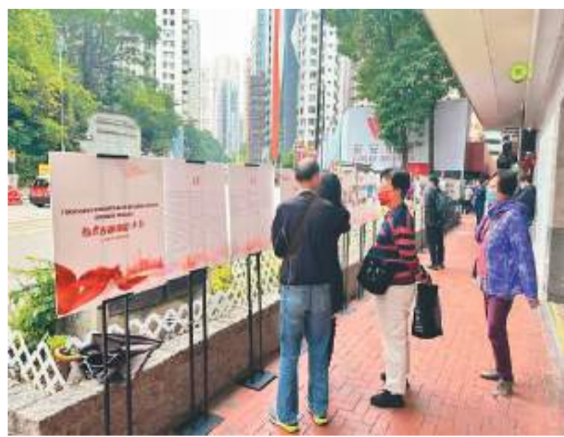
一月十一日，魅力古都·京彩十年北京城市风貌影像巡回展在港举行。图为香港市民在参观展览。