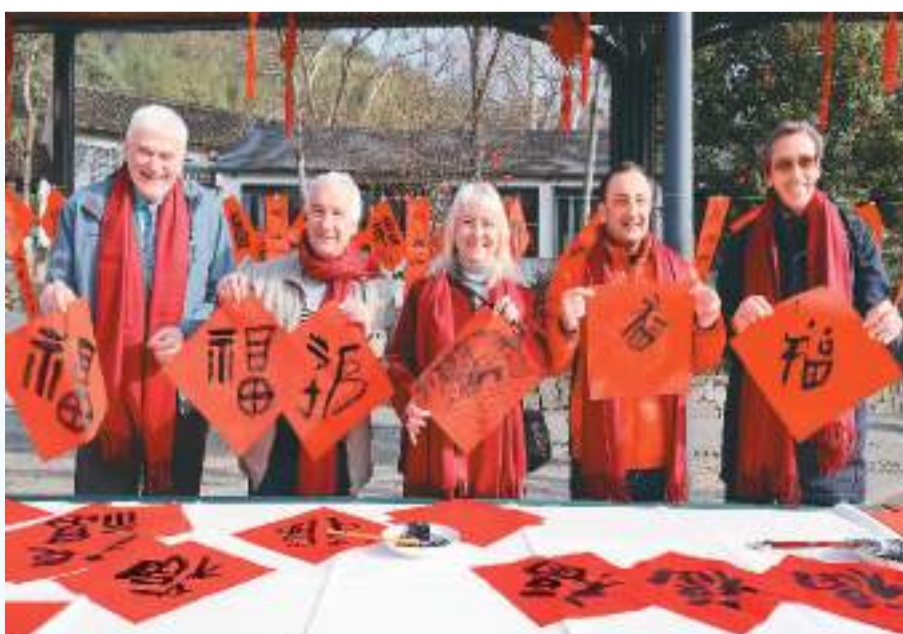
1月11日,浙江省湖州市德清县莫干山镇举办迎春文化雅集年俗活动,来自巴基斯坦等国家的外国友人在当地村民的指导下,体验写福字、打年糕、捻米粉等中国传统年俗。图为在莫干山镇度假村广场,外国友人展示刚写好的福字。