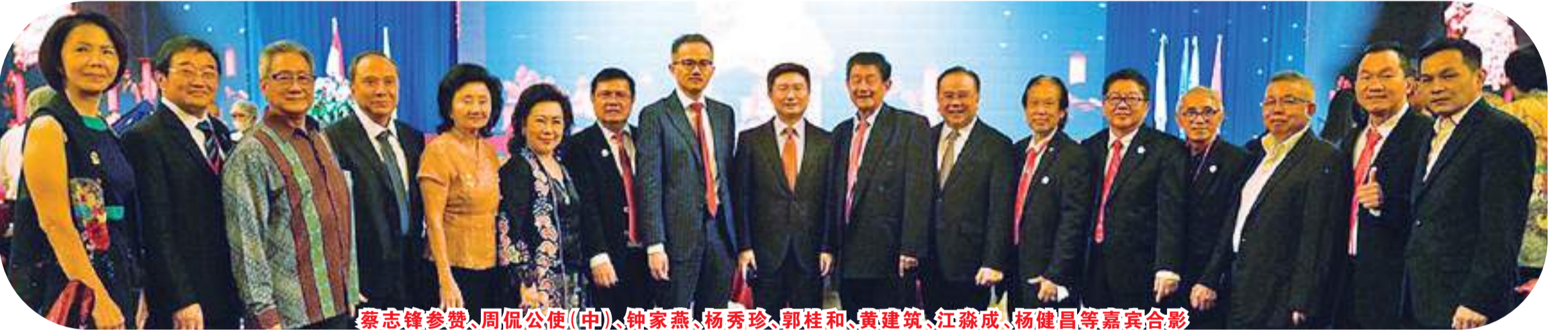
蔡志鋒參贊、周侃公使(中)、鍾家燕、楊秀珍、郭桂和、黃建筑、江淼成、楊健昌等嘉賓合影