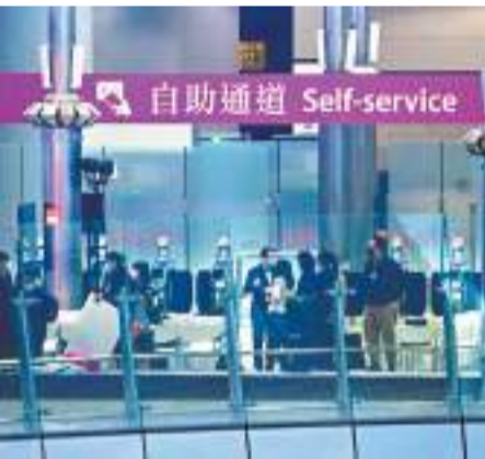
11日，高鐵路西九龍站內大批工作人員緊鑼密鼓為復運作準備。