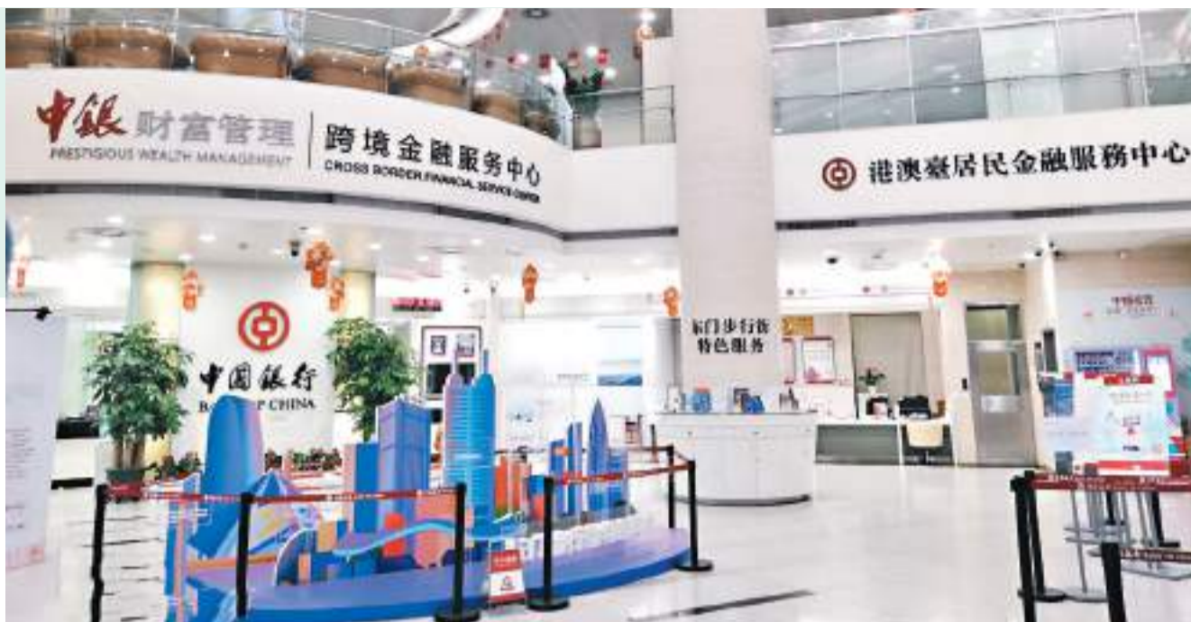
◆ 中國兩部門聯合發布的《通知》中指出，要滿足企業人民幣貿易融資需求，並結合貿易特點進一步創新產品服務。