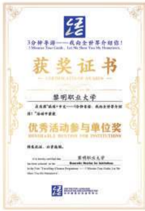
黎明职业大学荣获首届“旅游+中文--3分钟导游：我向全世界介绍你！”优秀活动参与单位奖