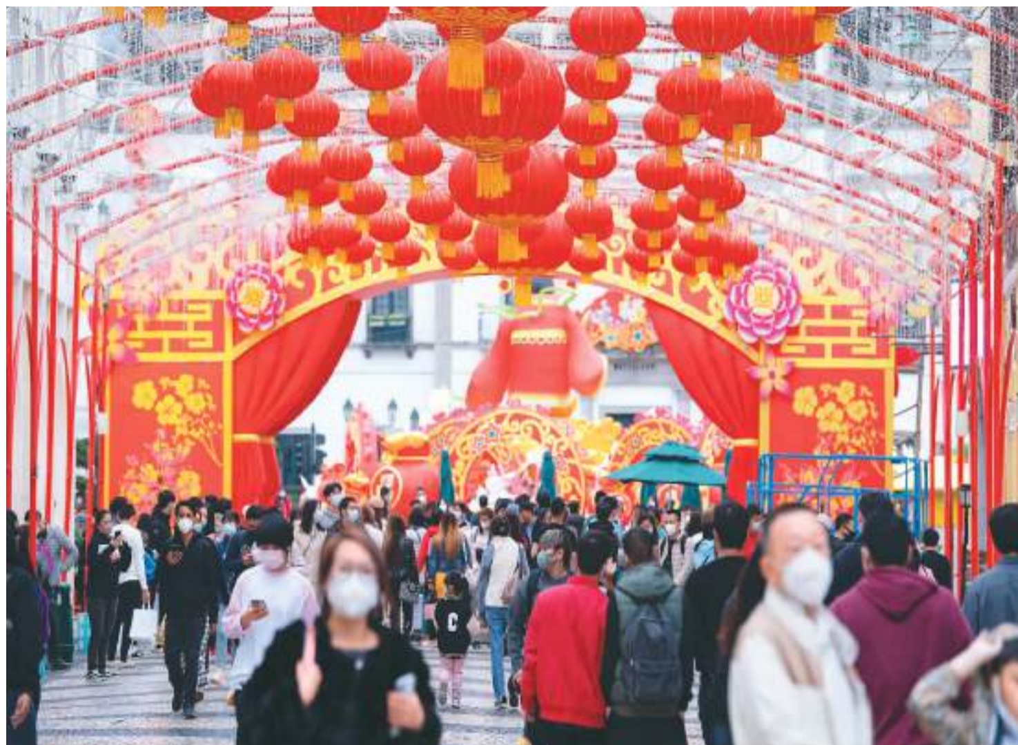
农历春节将至，澳门街头张灯结彩，充满浓浓的年味。澳门特区政府陆续推出多项精彩文旅活动，吸引游客感受澳门魅力，促进消费振兴经济。图为近日澳门大三巴牌坊和喷水池一带人流畅旺，附近零售商户顾客众多，充满活力。

特区国安委表示，支持香港特区政府尽快就《法律执业者条例》提出修订，适当处理没有本地全面执业资格的海外律师参与处理涉及国家安全案件的问题。