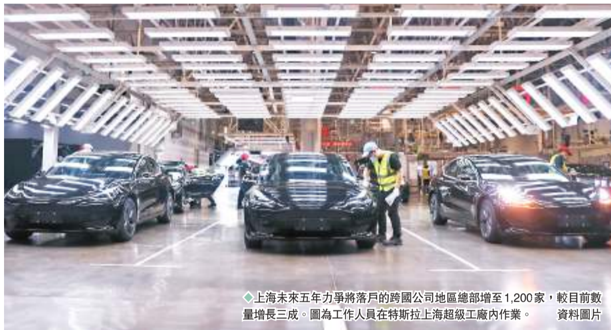
◆上海未來五年力爭將落戶的跨國公司地區總部增至1,200家，較目前數量增長三成。圖為工作人員在特斯拉上海超級工廠內作業。

權衡還認為，今年各種財政政策、貨幣政策、社會政策等可有效銜接、相互支持。例如，財政政策還是要增強針對性、有效性，尤其是減稅降費方面還有進一步的空間；同時，財政政策能夠為相關的市場主體，包括國有、民營和外資等各類市場主體，創造更加公平競爭的營商環境。