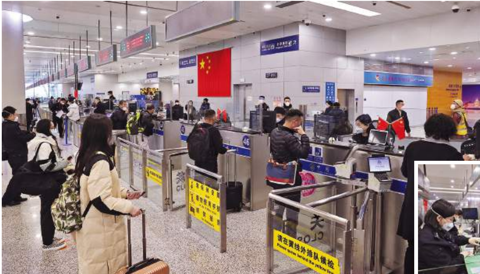
The first group of arriving travelers from overseas goes through immigration formalities at Shanghai Pudong International Airport. China lifted quarantine requirements as well as on-arrival PCR test for inbound travelers on January 8, ending almost three years of COVID-19 restrictions.