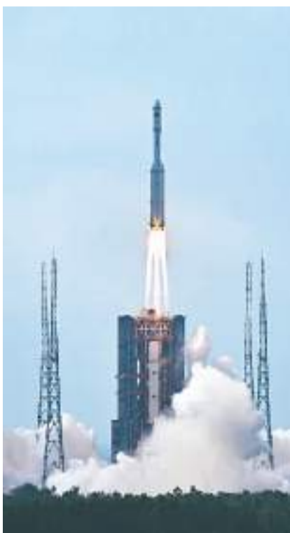
天舟五号货运飞船成功发射

2023年，中国航天依旧精彩。在继续保持高密度发射频次的同时，新的运载火箭、新的发射任务将进一步深化人类对宇宙的认知，为促进人类文明进步、增进人类共同福祉作出贡献。