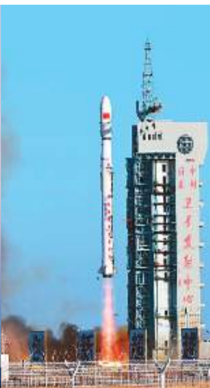
试验二十号A/B星成功发射