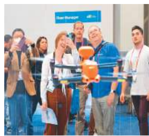
观众在美国拉斯维加斯消费电子展上参观深圳道通智能航空技术股份有限公司的无人机。