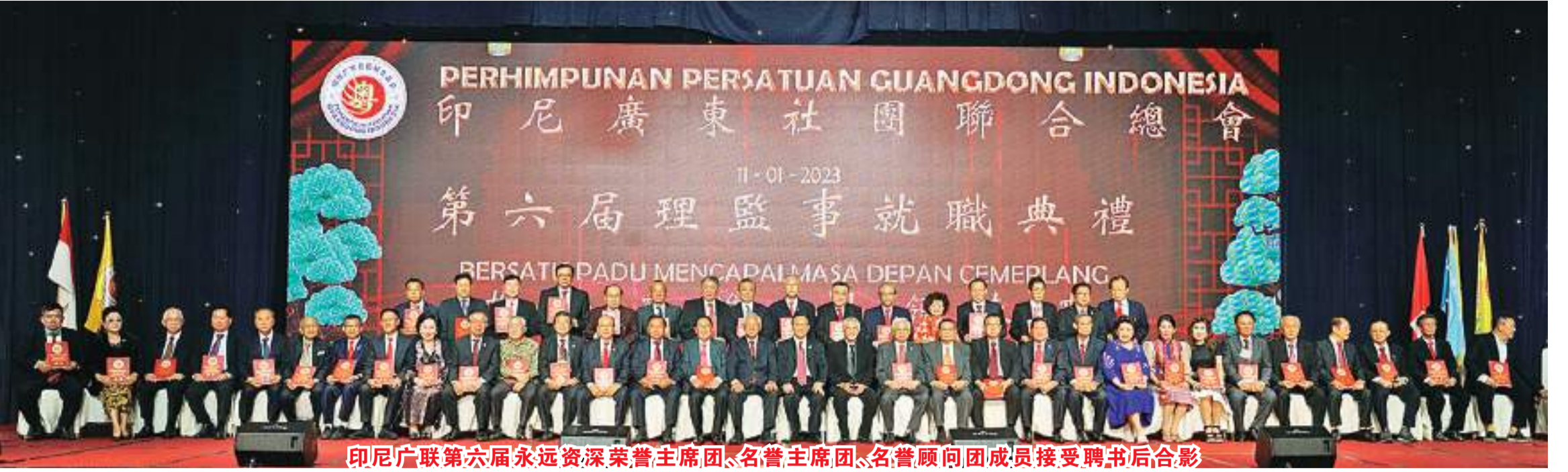
印尼廣聯第六屆永遠資深榮譽主席團、名譽主席團、名譽顧問團成員接受聘書後合影