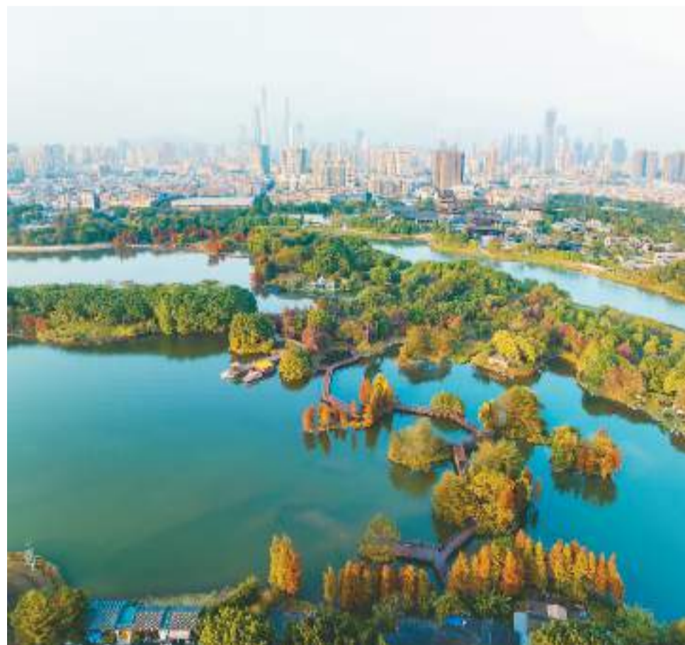
广州海珠国家湿地公园地处广东省广州市海珠区东南隅,这里水网交织,绿树婆娑,融汇了繁华都市与自然生态,为城市提供了全面的生态服务,是名副其实的广州“绿心”。图为近日广州海珠国家湿地公园美景如画。

同时,工信部还将完善工业互联网技术体系、标准体系、应用体系,推进5G行业虚拟专网建设。完善电信业务市场发展政策,强化App全流程、全链条治理,加强个人信息保护、用户权益保护。增强网络和数据安全保障能力,加快安全产业创新发展。