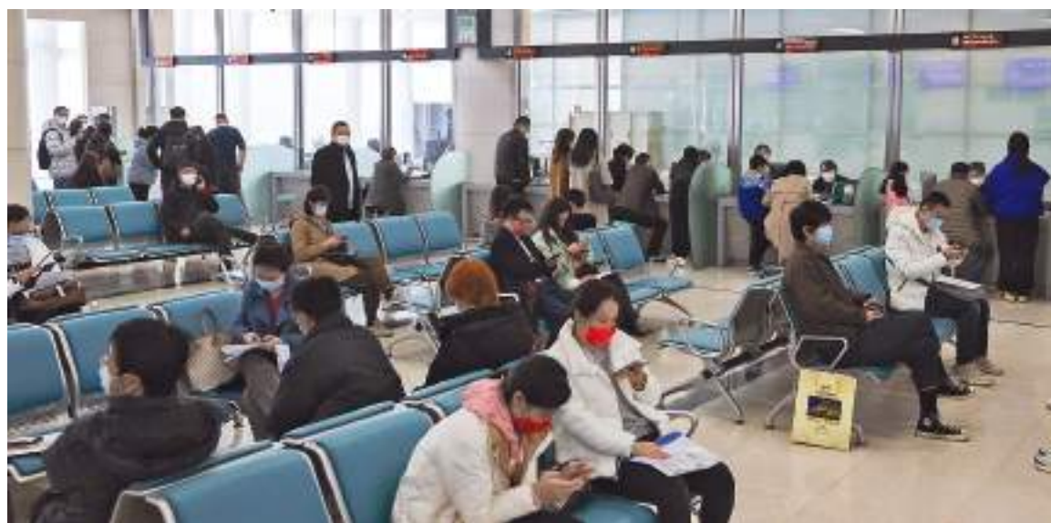
A throng of people waits for services at the Shanghai Exit-Entry Administration Bureau on Monday.

packed with people who had made online appointments on Monday.