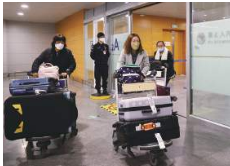
The area for the transfer of arrivals to central quarantine has been done away with at Shanghai Pudong airport. Immigration officers no longer wear “dabai,” or hazmat protection suits. All entry procedures are back to normal.