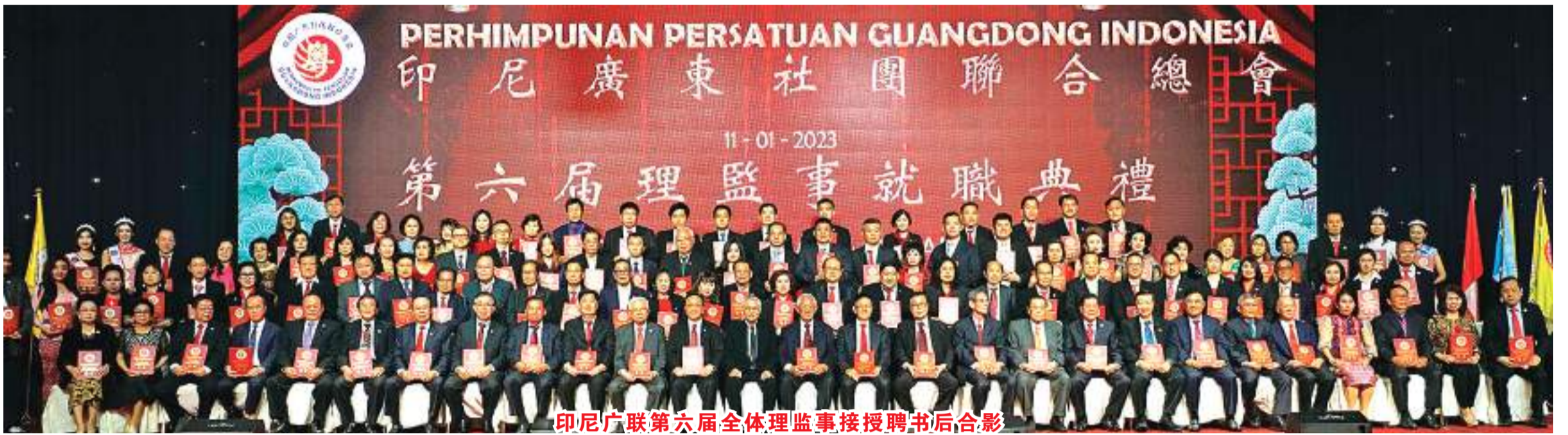
印尼广联第六届全体理监事授聘书后合影