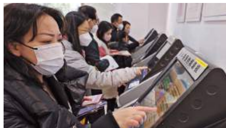
People fill in their application forms at the Shanghai Exit-Entry Administration Bureau on Monday.