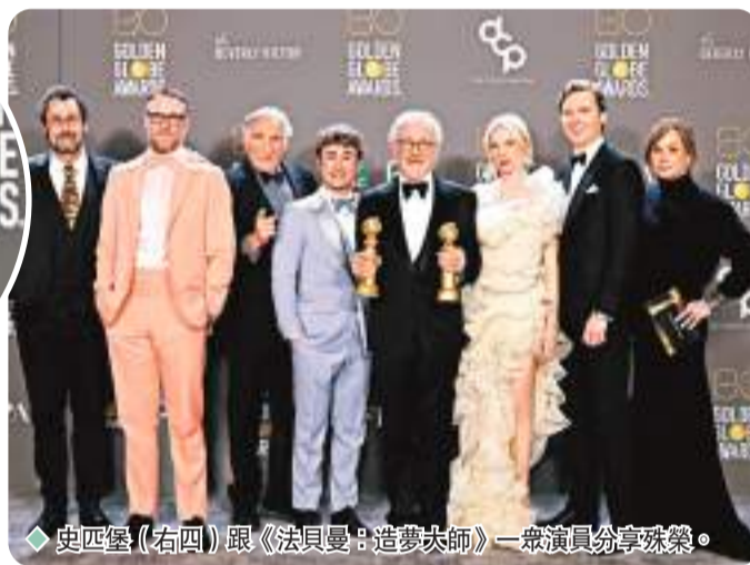
史匹堡(右四)跟《法貝曼:造夢大師》一眾演員分享殊榮。