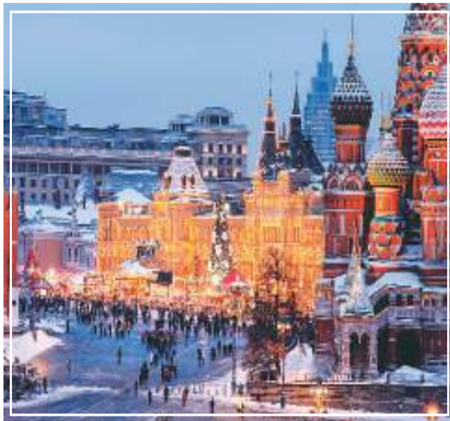
华灯初上的莫斯科。

10月中旬的莫斯科,正值金秋时节。公园里、街道旁色彩缤纷的树叶随着清冷的微风摇曳。我与之前一样,住在文化公园旁的共青团大街,望着每一个熟悉的街角,望着熙熙攘攘穿行而过的人流,与我的老友热烈相拥交谈。我有些恍惚,这里好似有了很多变化,又好似一切都未曾变过。