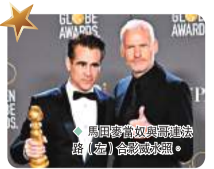
馬田麥當奴與哥連法路(左)合談成冰融。

另外,早於第51屆金球獎已獲封最佳女主角的安祖娜比莎,今屆亦成功憑《黑豹2:瓦干達萬歲》奪得最佳女配角殊榮,拿下她的第二座金球獎。她在領獎時表示與拍攝團隊每天都被已故男星「黑豹」查特域克布斯曼(Chadwick Boseman)的光芒及精神包圍,他們一同帶着愛踏上這段拍攝旅程。她表示:「我們在鏡頭前後都向世界展示了黑人的團結、領導力及愛。」