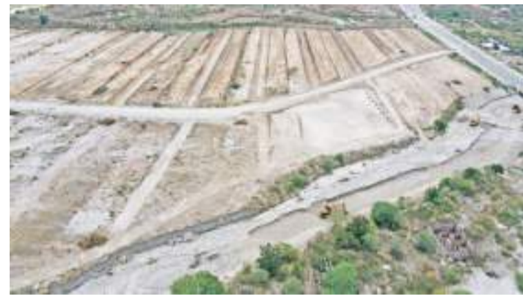
公共工程与民居部在中苏省兴建民房 1月12日,公共工程与民居部开始在中苏省Tondo Dua区发展住宅区。这项工程地皮面积约达65.31公顷,预计能建设1055间民房。

盟(EU)在世贸组织起诉并判决我国败诉,但印度尼西亚正在向前推进并提出上诉。佐科维声称,随着出口禁令的实施,印度尼西亚的附加值将大幅增加,从之前的17万亿盾左右增加到2021年的360万亿盾。