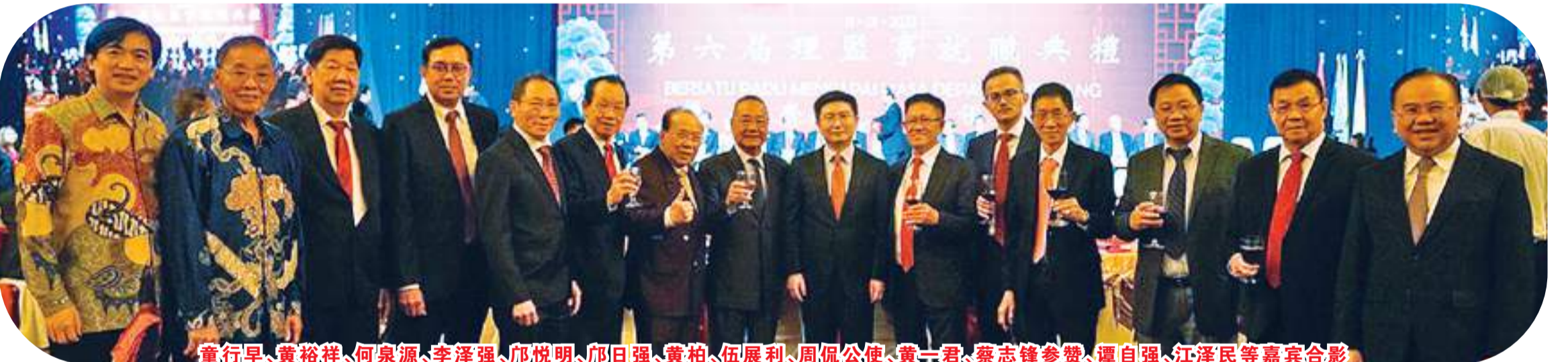
童行早、黃裕祥、何泉源、李澤強、邱悅明、邱日強、黃柏、伍展利、周侃公使、黃一君、蔡志鋒參贊、譚自強、江澤民等嘉賓合影