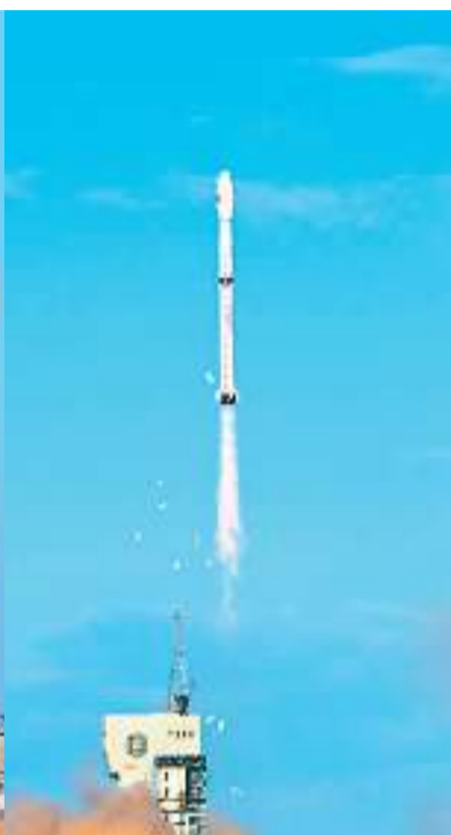
遥感三十三号02星发射升空