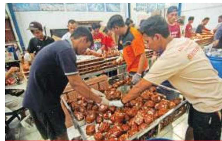
春节日益临近,年糕开始热卖 1月12日,春节的脚步日益临近。中爪哇省直葛市 (Tegal) 某家庭工业正紧张制作年糕,以供应市场的需要。这里年糕每公斤卖价为2.4万至2.7万盾。

他说,所获头衔已符合了印尼鹰航空公司要加快各种绩效转型步骤所做出的努力。这一成就也激发了印尼鹰航空公司的乐观态度,不论在服务、安全和准时等方面,持续为社会提供最佳的航空服务。