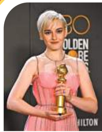
茉莉亞嘉納憑演出《黑錢勝地》奪獎。