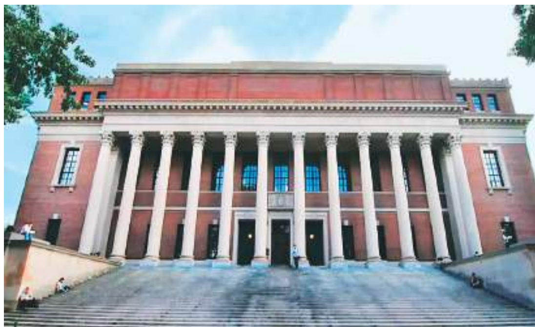
哈佛大学怀德纳图书馆。