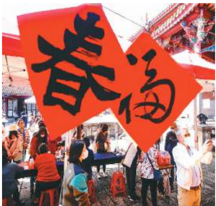
为迎接农历新年，台湾台北市孔庙近日邀请书法家现场挥毫写春联，民众一起体验剪纸、春联、斗方、红包袋等活动，感受浓浓年味。图为活动现场。

参加座谈会的31名台湾青年在京从事文化艺术、教育、医疗卫生、金融、法律、企业经营等工作，或在高校求学。