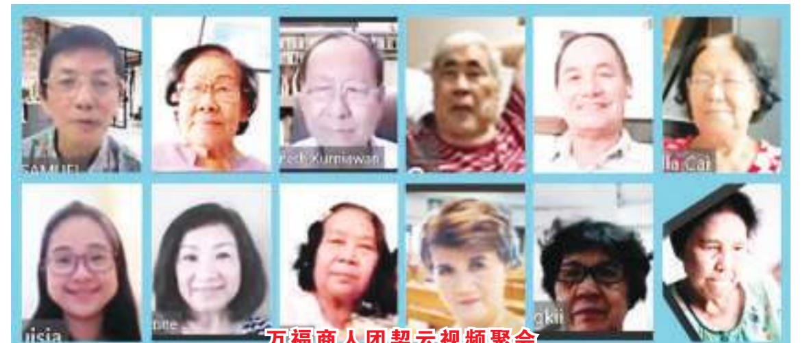
万福商人团契云视频聚会