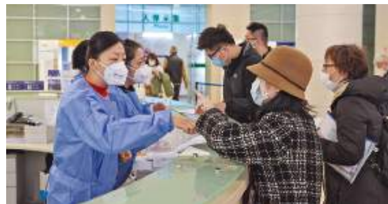
People make inquiries at the Shanghai Exit-Entry Administration Bureau on Monday.

Meanwhile in Beijing, the Beijing Exit-Entry Administration Bureau's waiting hall was