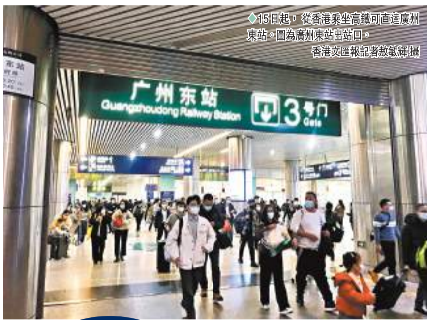
15日起，從香港乘坐高鐵可直達廣州東站。圖為廣州東站出口。

在恢復營運初期，內地鐵路部門將安排開行廣州、深圳地區往香港西九龍方向的跨境高鐵列車，日均開行高鐵動車組旅客列車38.5對。其中，香港西九龍至廣州南8對、至廣州東6對、至深圳北10.5對、至福田14對。下一步，鐵路部門還將根據客流情況，適時對跨境高鐵列車開行方案進行優化調整，持續推進跨境高鐵旅客運輸有序恢復。