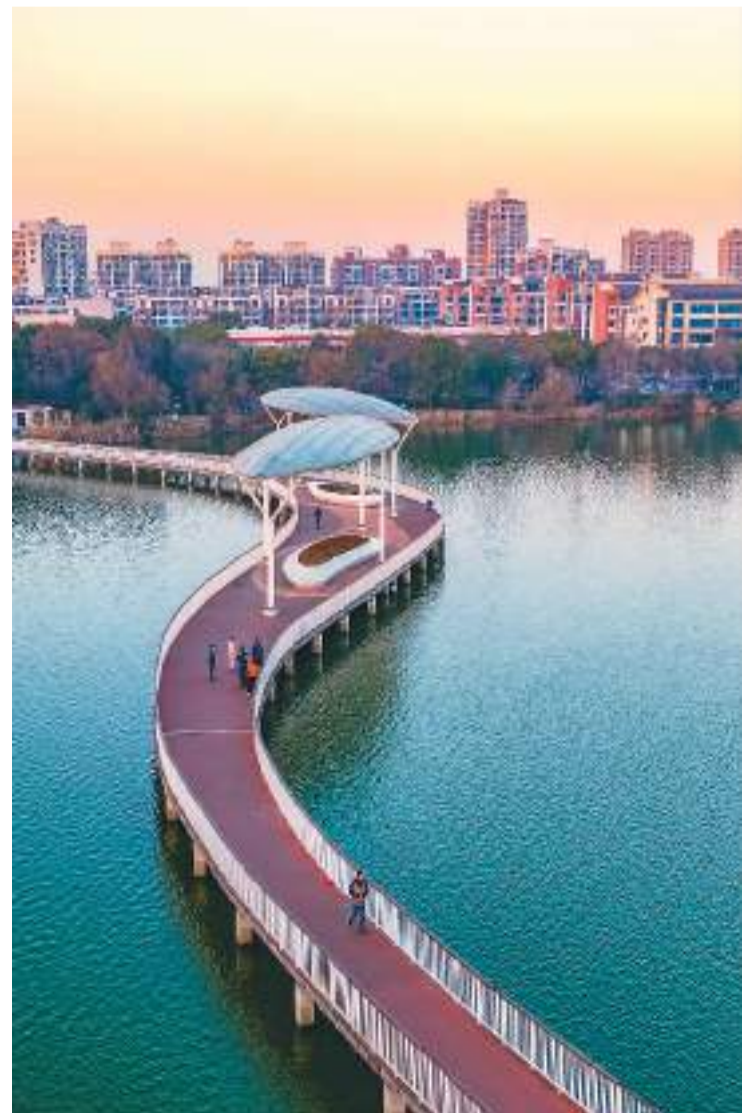
近年来,安徽省芜湖市大力发展生态城市,促进人与自然和谐共生。图为1月11日,市民在该市鸠江区银湖公园亲水长廊上休闲散步。