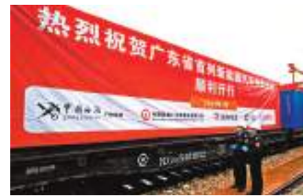
廣州海關關員對即將發運的中歐班列進行監管。

點正式啟用以來，該站點累計開行進出口班列167列，形成6條常規固定線路從全國5個鐵路口岸進出境，將電子產品、服裝鞋帽、家用電器、機械設備等「中國製造」商品源源不斷送達海外市場。