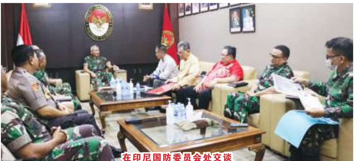
在印尼国防委员会处交谈

的，是传达群岛文化周的计划，作为一系列元宵节(Cap Go Meh)庆祝活动，将于1日至12日在日里雪黎冷县举行。即将到来的2023年2月4日。该活动将充满各种活动，包括来自群岛的文化表演，研讨会和