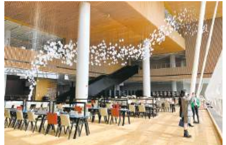
Artist Xu Bing's giant installation "Living Word" becomes one of the most popular photo spots at the new library.

The three-hour interview was conducted while strolling around the new library, often stopping for observations like this. The architect, who visits