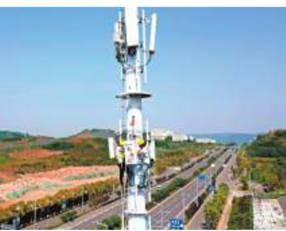
中國將啟動「寬帶邊疆」建設，全面推進6G技術研發，圖為工作人員在位於重慶高新區高新大道的5G基站建設現場作業。資料圖片

會議還提出，力爭到2023年底，全國專精特新中小企業超過8萬家、「小巨人」企業超過1萬家；加快5G和千兆光網建設，啟動「寬帶邊疆」建設，全面推進6G技術研發等。