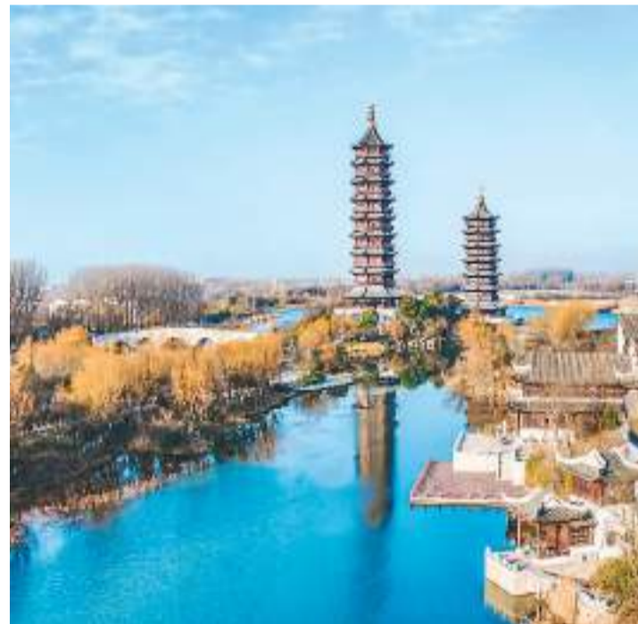
近年来,江苏省宿迁市宿城区坚持生态优先、绿色发展,着力打造绿色水美生态廊道。图为该区古黄河双塔公园全景如画。

全国政协副主席、党组副书记张庆黎,全国政协副主席、党组成员刘奇葆、卢展工、马晓伟、李斌、巴特尔、汪永清、何立峰出席会议并发言。全国政协机关党组成员、各专门委员会分党组负责同志等参加学习。