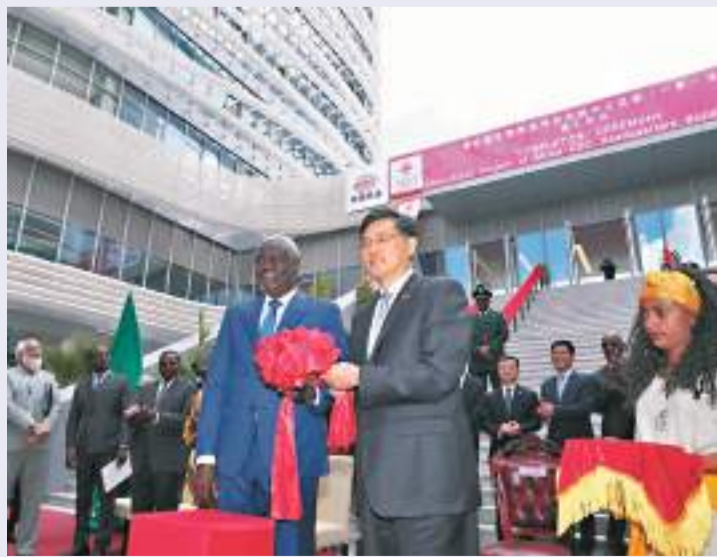
◆當地時間11日，在埃塞俄比亞首都亞的斯亞貝巴，中國外交部長秦剛（中右）與非盟委員會主席法基（中左）出席非洲疾控中心總部項目竣工儀式。

秦剛強調，中國從不開「空頭支票」，更不會強人所難。我們將把非洲疾控中心總部圓滿轉交給非洲朋友，由非盟全權運營管理。如果非方有需要，我們也會竭盡所能，繼續提供支持和幫助。非洲疾控中心總部已經巍然屹立於我們身後，這是中非雙方的兄弟姐妹們用傳統友誼和辛勤汗水澆築起來的偉大豐碑，它用無可辯駁的事實告訴世界，中國始終以實際行動支持非洲，中非關係的未來必將更加美好。