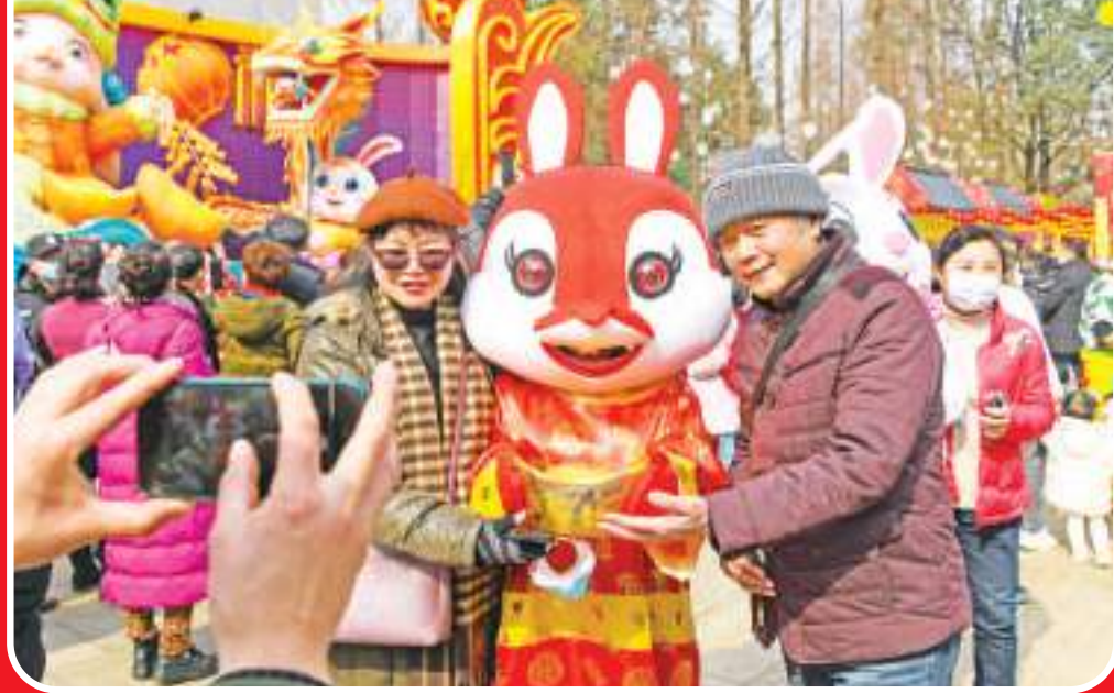
1月25日,在四川成都2023金沙太阳节活动现场,游客和“招财兔”合影。春节期间,各地举行丰富多彩的活动喜庆新春。