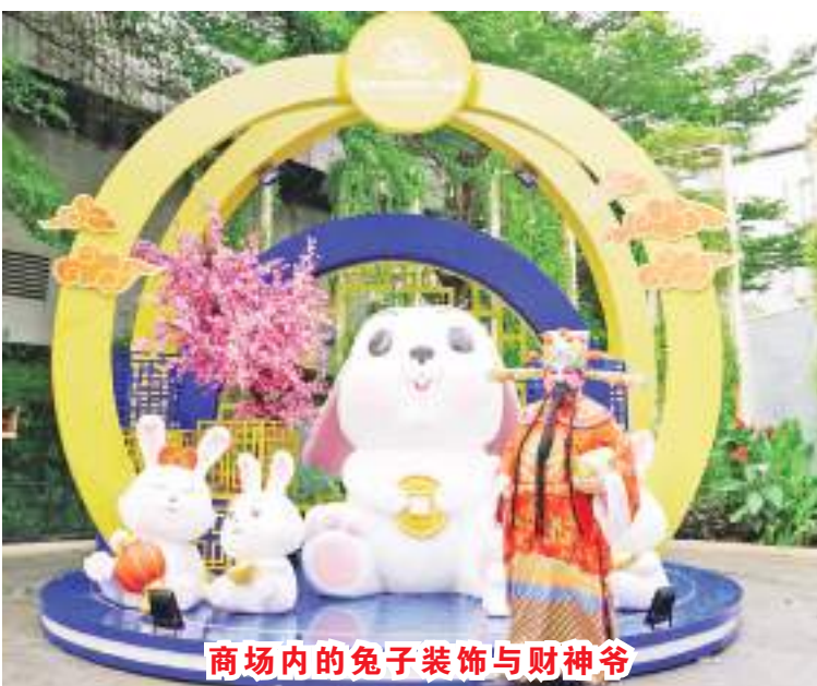
商场内的兔子装饰与财神爷

情。Blueming Lunar 提供各种有趣的娱乐节目,例如: 中国杂技 2023年1月21日 19:00 中国书法 2023年1月21日 13:00 中国舞蹈 2023年1月21-22日 15:00 武术 2023年1月22日 18:30 太鼓 1月29日 16:00、2023年2月2日 14:00 口琴弦乐四重奏,2023年1月29日、2月4-5日 17:00 古筝演奏,1月28日 16:00、2月4日 17:30 一风堂烹饪班,2023年1月20日、2月27日和2月3日 16:00 寿司制作班(元气寿司),2023年1月29日和2月5日 10:30 舞狮表演,1月21日、28日、29日 14:00和2023年2月4日和5日 16:00