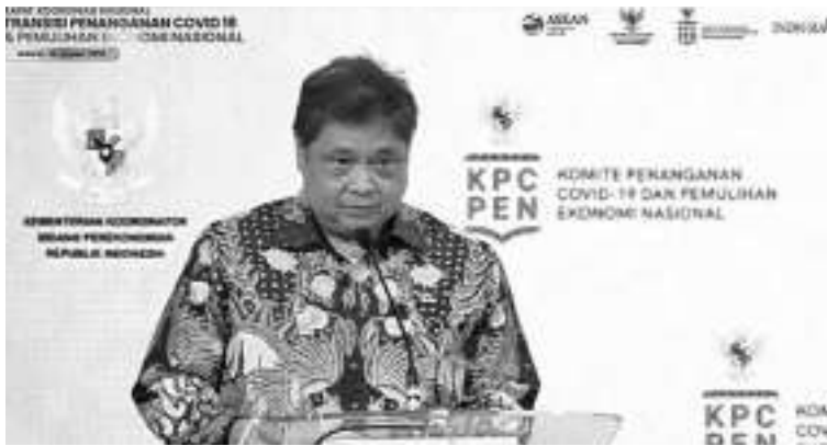
处理新冠工作组确保全国恢复活力

人取得的贷款价值同比增长了15%,个人债务人则同比增长了8.1%。营运资本贷款同比增长了11.7%,比上一月增长了11.6%稍微高一点。在营运资本贷款方面,2022年12月份的制造业领域或同比增长了11%,比上一月同比增长了10.9%略高一点;建筑领域同比增长了5.9%,比上一月同比增长了3.7%更高。同时期的消费贷款也同比增长了9.4%,比上一月同比增长了9.1%更高,这是因为机动车贷款和多用途贷款有所增长所致。在2022年12月期间,在贷款发放方面,企业债