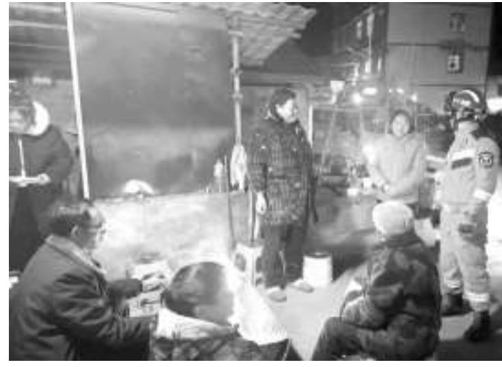
图为泸定消防救援力量在震区排查。