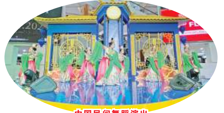
中国民间舞蹈演出

【本报讯】为迎接2023年1月22日农历新年庆祝活动,全宝集团(Summarecon Group)所属在椰风新城 Summarecon Mall 大商场(MKG)举办一项名为“Blueming Lunar”的活动。