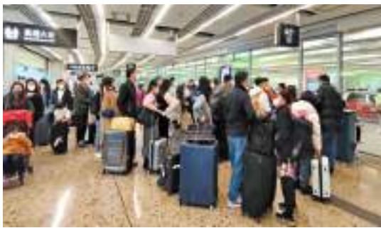
昨日有大批市民經高鐵回鄉或返港。記者 蔡啓文攝

【香港商報訊】記者戴合聲、林駿強報道：昨日大年初四，是本港春節假期最後一天，大批北上過節港人陸續回港，據內地鐵路售票網站顯示，昨日穗深至香港高鐵票已售完。記者當天特意到西九龍站採訪，發現抵港大堂及離港大堂均人如潮，現場氣氛熱鬧。