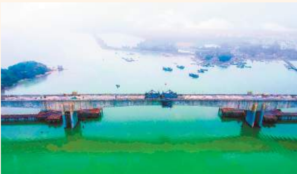
濠江特大橋跨濠江水道160米剛構連續梁順利實現合龍。

【汕頭日報訊】汕頭市濠江水道長虹卧波！1月14日凌晨三時，歷經連續4個小時的混凝土澆築，廣東省、汕頭市重點項目汕汕鐵路全綫水中最大跨度連續梁——濠江特大橋跨濠江水道160米剛構連續梁順利合龍，這標志着中鐵十四局汕汕鐵路站前六標所有橋梁綫下工程全部完成。