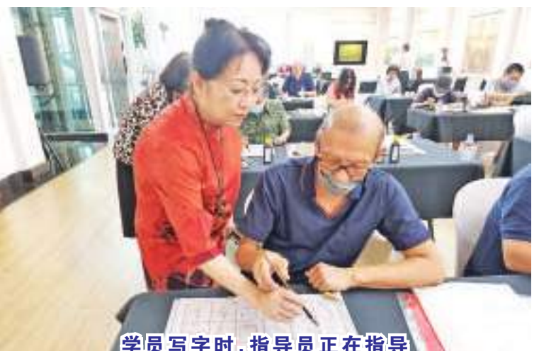
学员写字时,指导员正在指导