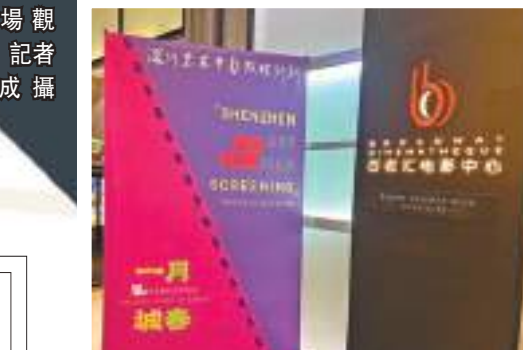
「深圳藝術電影放映計劃」海報。

今年春節檔共有7部影片，可謂是「臥虎藏龍」，題材覆蓋喜劇、科幻、懸疑、體育、動畫等，相比往年更加豐富多元。從口碑來說，今年春節檔新片的質量認可度普遍較高。社交網絡上，「春節影評大賽」如火如荼，有人認為《流浪地球2》標定了國產科幻新高度，有人喜歡《滿江紅》的家國情懷，也有人被《深海》獨特的敘事感動。