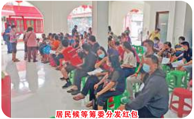
居民候等筹委分发红包