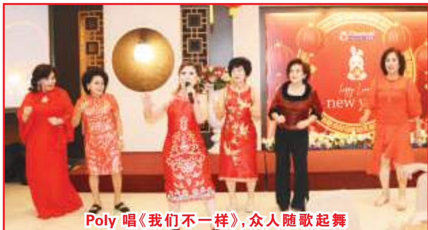
Poly唱《我们不一样》,众人随歌起舞