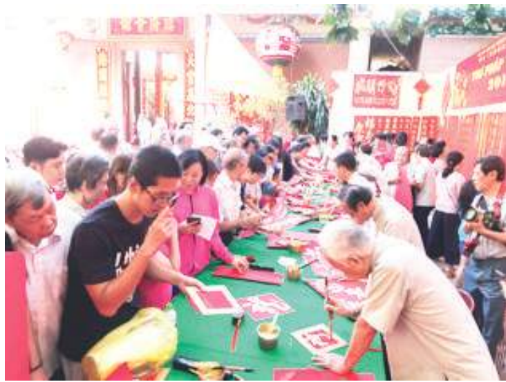
慈善挥春的场面人山人海