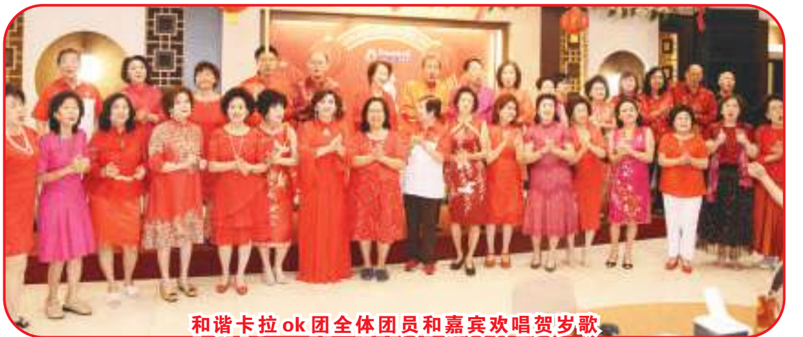
和谐卡拉ok团全体团员和嘉宾欢唱贺岁歌