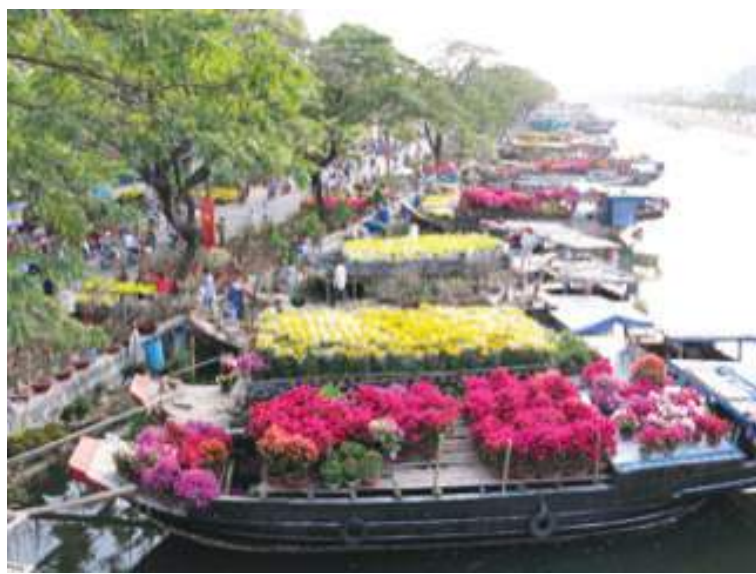
载满春花的船只停泊在第八郡平东码头街