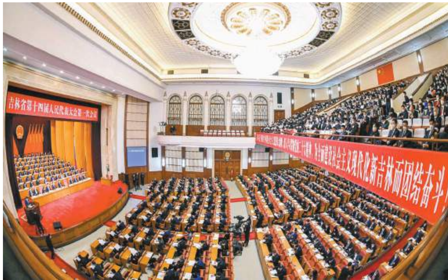
1月15日，吉林省十四屆人大一次會議在長春開幕。圖為大會會場。丁研 張野攝