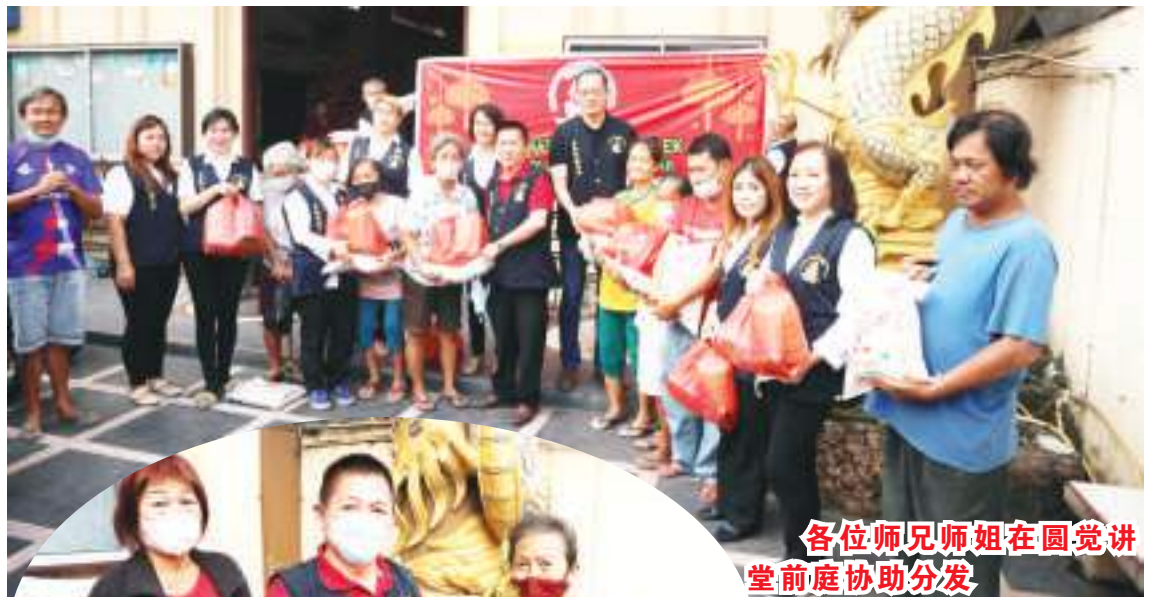
各位师兄师姐在圆觉讲堂前庭协助分发