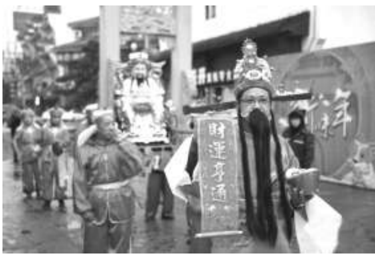
资料图:“财神”正在送大运。当日为农历正月初五,民间素有迎财神的传统习俗。

管辖原则,切实尊重苏丹国家司法主权,充分听取苏丹政府有关意见,在调查、检控和审判中秉持独立、公正和客观立场,确保所做工作有助于促进苏丹司法正义、实现持久和平。