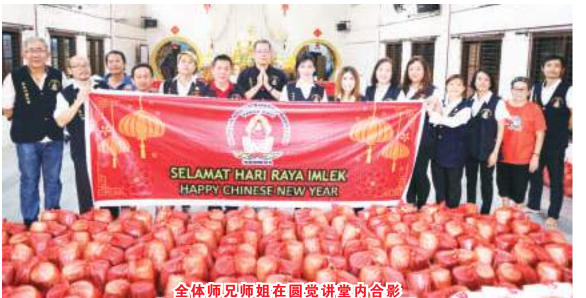
全体师兄师姐在圆觉讲堂内合影