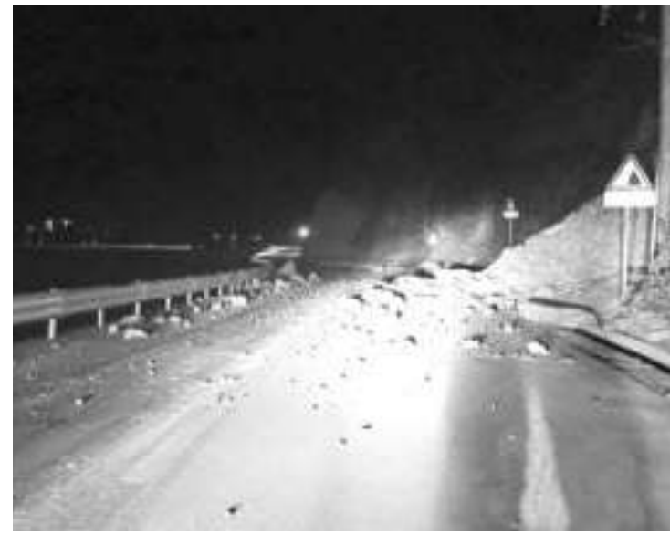
前往得妥镇和海螺沟景区的道路有个别路段出现落石或垮塌。

四川省应急管理厅称,经初步排查,受地震影响的甘孜州泸定县得妥镇、德威镇、冷碛镇、兴隆镇和雅安市石棉县新民乡、草科乡、王岗平乡等暂未发现人员伤亡和房屋倒塌等情况。相关排查工作仍在进行。