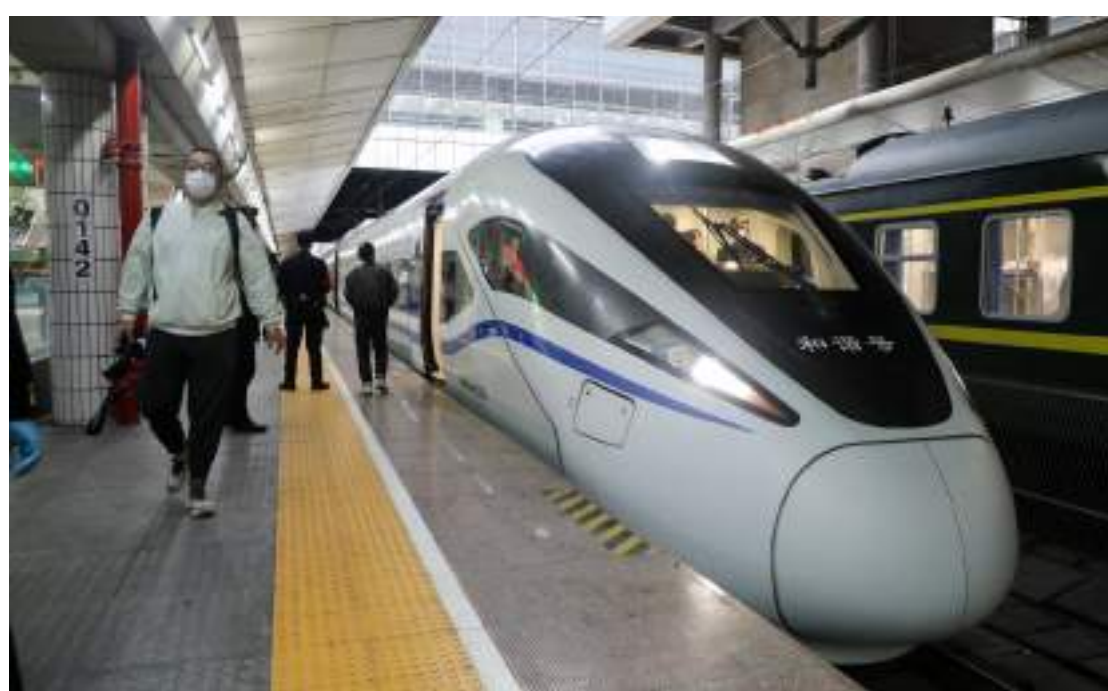
1 月 15 日 7 時 50 分許，廣州東站首次開行往香港西九龍站方向的 G6551 次高鐵正在等候乘客上車。

香港青年、廣州資資創業投資管理有限公司合夥人林諾謙聽到廣深港高鐵香港段恢復通車的消息馬上打算買票，“我公司在珠江新城，10 多分鐘就能到廣州東站，坐上高鐵 1 個多小時就能抵達香港了。”這一趟回港，林諾謙除了要和家人共度春節，還