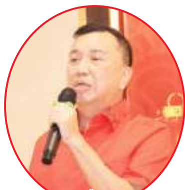
黄淡生唱《最爱是你》