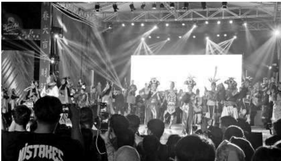
西加省山口洋市迎春晚会。

晚上真的成为庆祝这座城市多元化的舞台,这个拥有我国最宽容城市的绰号。所有人都被赋予了相同的表达空间。