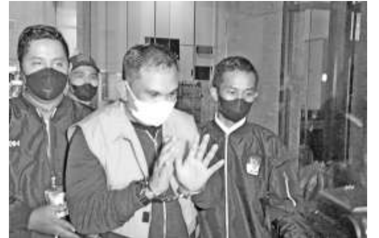
腐败案逃犯前亚齐独立运动组织总司令阿兹哈尔(Izil Azhar)。

【本报讯】腐败案逃犯前亚齐独立运动组织(GAM)总司令阿兹哈尔(Izil Azhar)被肃贪委拘留20天。