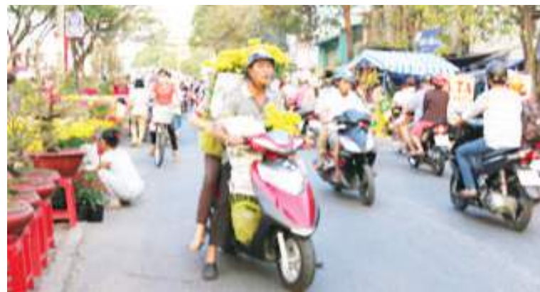
消费者把挑选好的迎春花载回家

高文楼街、梅春赏街等,徒步走过横跨豆腐涌的五、六号步行桥前往第八郡平东码头花市观赏、或购买一盆盆“满意”回家。