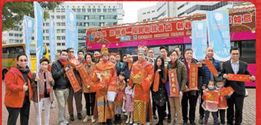
昨日大年初四為民間「接財神日」，經民聯核心成員和青委會、地區骨幹一行數十人乘搭新春賀年花車，赴香港各區向市民拜年。經民聯主席盧偉國和青委會顧問趙志浩打扮成財神，和大家一起向街坊大派賀年朱古力金幣利是，送上暖暖的新年祝福，為香港打氣、為經濟民生復常加油。花車所到之處備受歡迎，沿途市民與車上人員揮手互道祝福，氣氛熱鬧祥和。