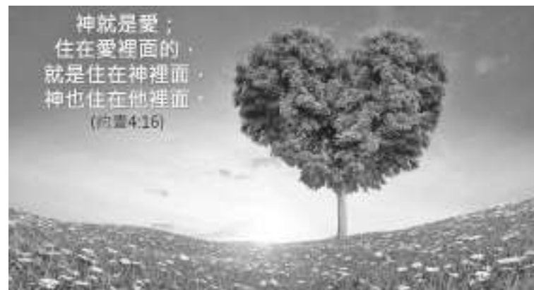
神就是爱；住在爱里面的，就是住在神里面，神也住在他里面。(约翰壹4:16)

假如没有爱，人生就是一场灾难。为什么没有爱？是因为人不认识上帝。上帝就是爱；不认识上帝，哪来的爱呢？