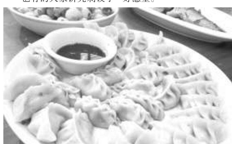
资料图:饺子,是过年期间的“主角”之一。