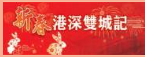
農曆新年期間，市面節日氣氛濃厚，商場、食肆等人氣鼎盛。