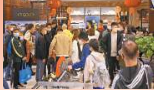
農曆新年期間，市面節日氣氛濃厚，商場、食肆等人氣鼎盛。

【香港商報訊】記者戴合聲報道：受惠於香港與深圳關口回復正常運作，跨境巴士和高鐵陸續恢復運營，本港防疫措施逐漸放寬，內外因素帶動本地消費氣氛持續向好。農曆新年期間，市面節日氣氛濃厚，不少市民和旅客置辦年貨、購物遊樂或團年相聚，令商場、食肆等人氣鼎盛。多個商場指，5天長假期生意額增加兩至三成。亦有會展業界人士預料，本港會議展覽業將於第二季出現明顯復蘇。