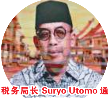
税局长 Suryo Utomo 通过视频致词