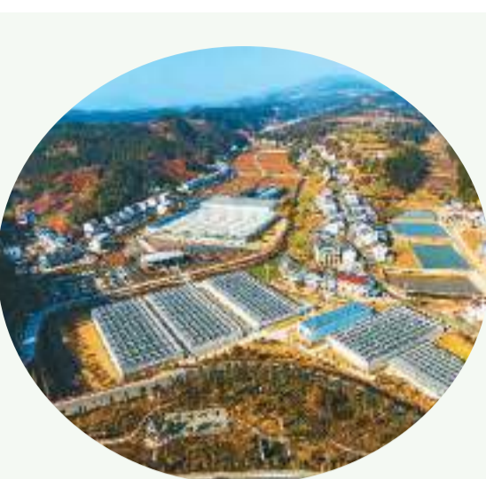
春节前夕,湖北省十堰市竹山县龙井村五福龙井智慧农业生态园内皇妃、紫霞、普罗旺斯等品种的圣女果在万余平方米的玻璃温室内陆续进入采收期...