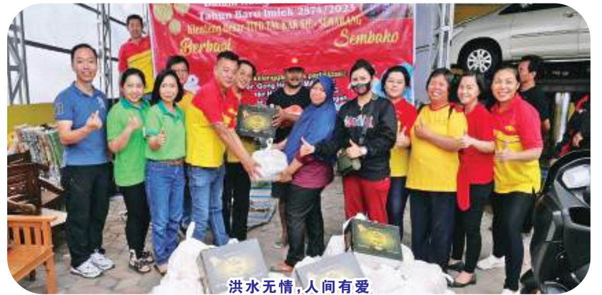
洪水无情,人间有爱