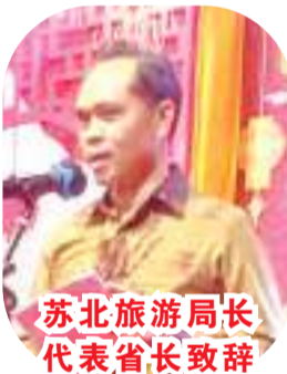
苏北旅游局长代表省长致辞