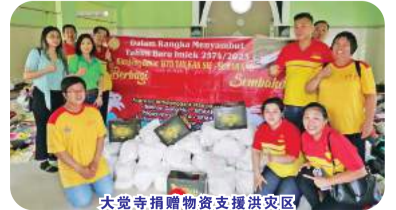
大觉寺捐赠物资支援洪灾区