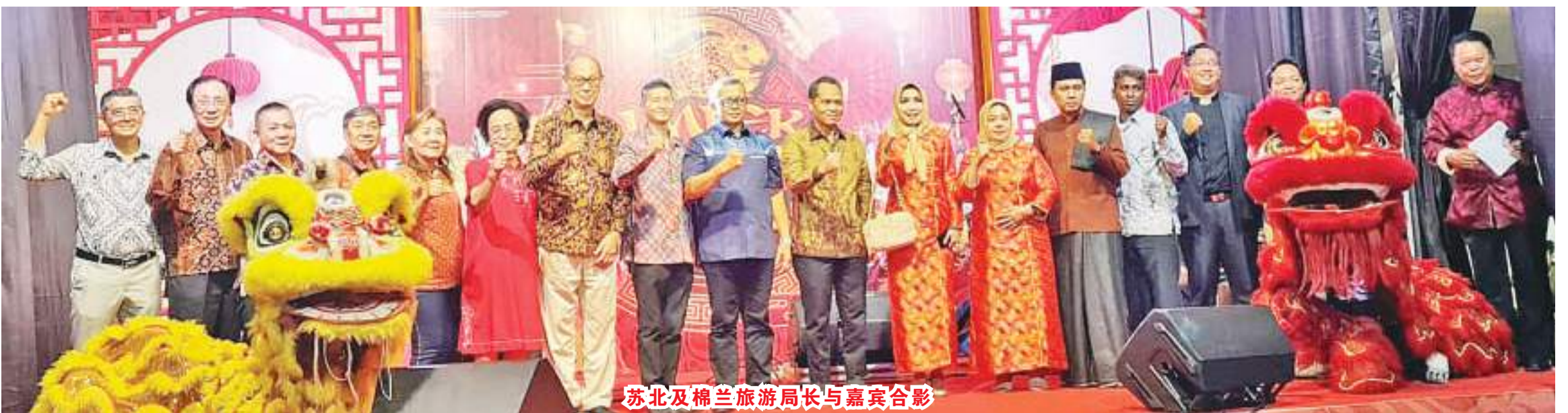
苏北及棉兰旅游局长与嘉宾合影