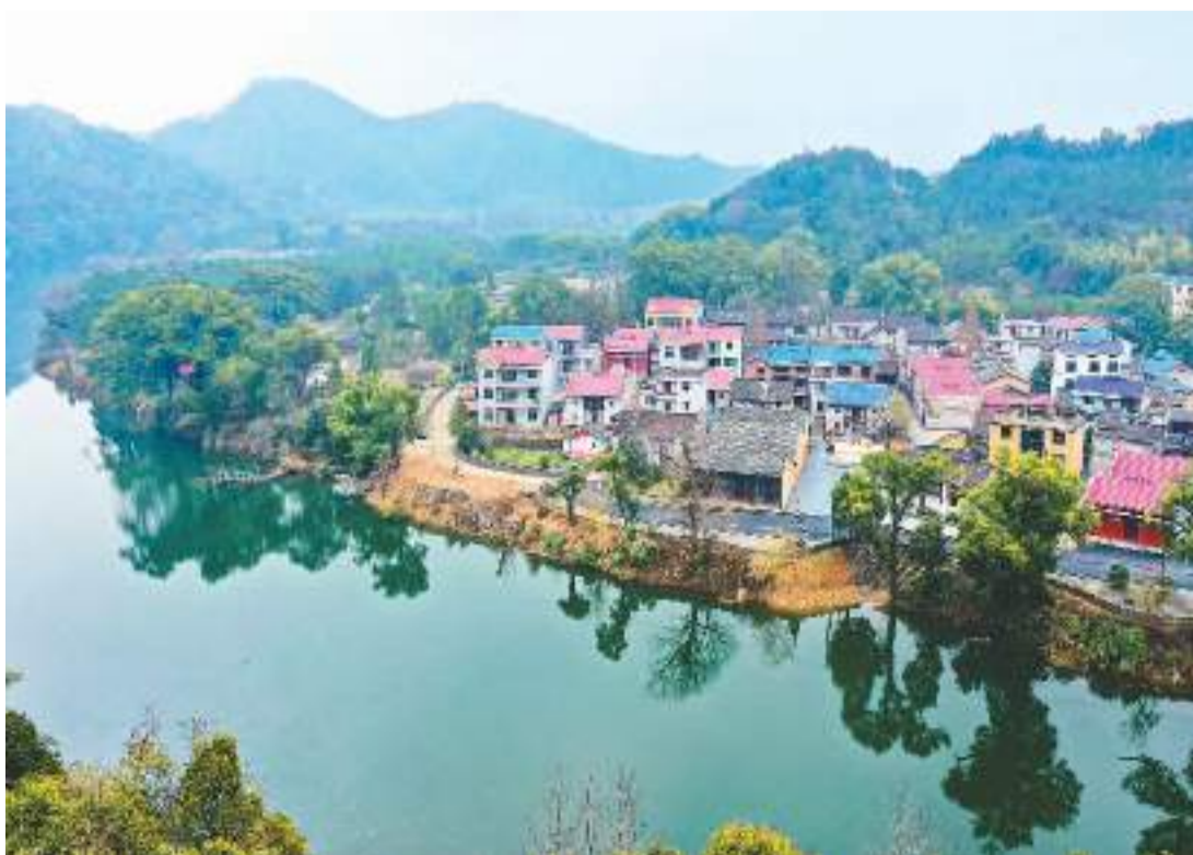
江西省吉安市吉水县在建设美丽乡村的同时强化生态管理，大力营造水清、岸绿、河畅、景美的绿色生态画卷。图为1月10日，吉水县白沙镇赤岸古村，山环水绕，景美如画。

新华社上海1月10日电 (记者董雪)记者从上海市科委获悉，上海加快建设大飞机产业体系，以突破核心、集成创新为重点，推动ARJ21新支线飞机规模化交付、C919大型客机交付首家用户。 根据上海市科委1月10日发布的《2022上海科技进步报告》，来自中国商飞的数据显示，2022年12月，C919大型客机首架机交付首家用户东方航空公司，迈出市场运营“第一步”。截至2022年底，C919累计获得32家客户1035架订单。ARJ21新支线飞机于2022年12月交付首家海外客户印尼翎亚航空。截至2022年底，ARJ21共获25家客户690架订单，累计交付9家国内外客户，共100架机。