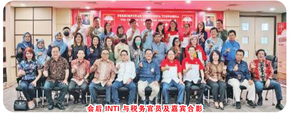
会后 INTI 与税务官员及嘉宾合影