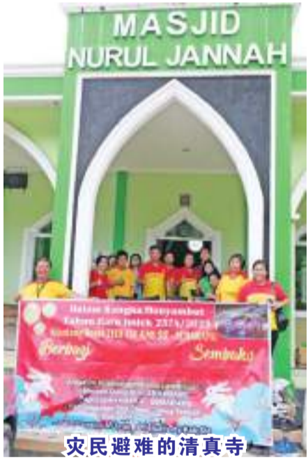
灾民避难的清真寺

【本报讯】连日来,三宝垄遭遇极端强降雨天气,多地洪水泛滥严重,居民家中淹水,停电断水,给群众生活带来很大困难。为切实做好受灾群众帮扶救助工作,1月8日,三宝垄理事及志愿者们积极联系受灾地区,为灾民捐赠一百条沙龙和一百个爱心包,努力解决灾民的温饱难题。