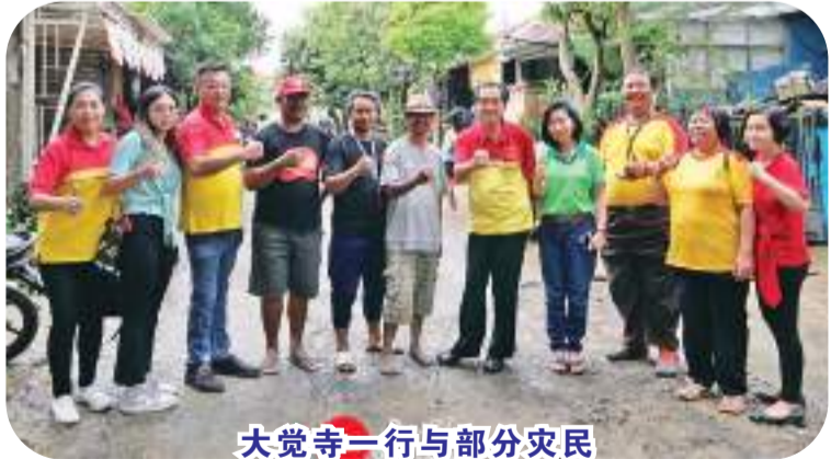
大觉寺一行与部分灾民