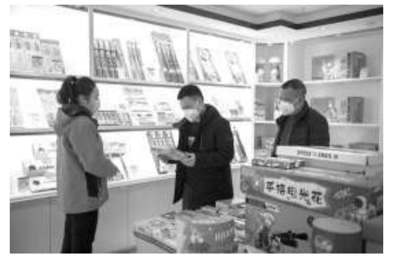
湖南浏阳:赶制花炮迎新年 1月11日,在浏阳市大瑶镇一家花炮销售中心,工作人员(右)向顾客介绍花炮。

中新网北京1月11日电 中国外交部发言人汪文斌11日主持例行记者会。有记者问:近期,多国出台了欢迎中国游客的举措。请问中方对此有何评论? 汪文斌:中方发布新冠病毒感染“乙类乙管”总体方案和中外人员往来暂行措施后,许多国家表示热烈欢迎中国游客到访,