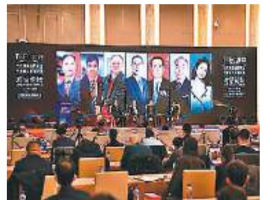
2023年第六届天下潮商经济年会对话论坛环节，与会嘉宾围绕“大变局中谋新突破”主题展开深入交流。