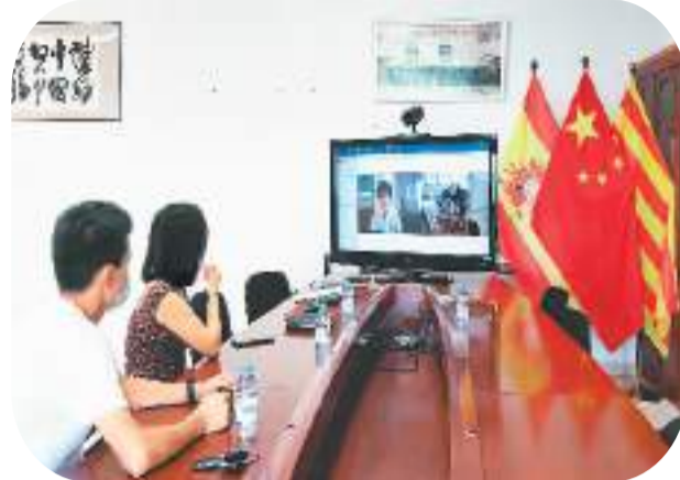
右图：2022年7月，在“天府云医·海外惠侨远程医疗站”西班牙巴塞罗那站，侨胞正在进行线上问诊。