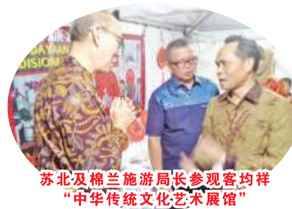
苏北及棉兰旅游局长参观客均祥“中华传统文化艺术展馆”