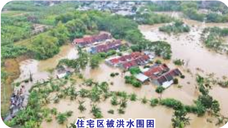
住宅区被洪水围困