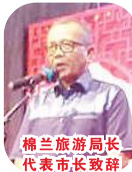
棉兰旅游局长代表市长致辞