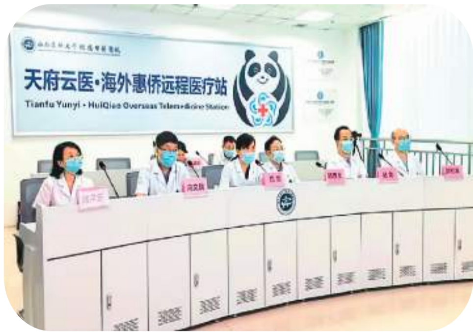
左图：2022年7月，在西南医科大学附属中医医院，专家们正在“天府云医·海外惠侨远程医疗站”进行线上联合会诊。