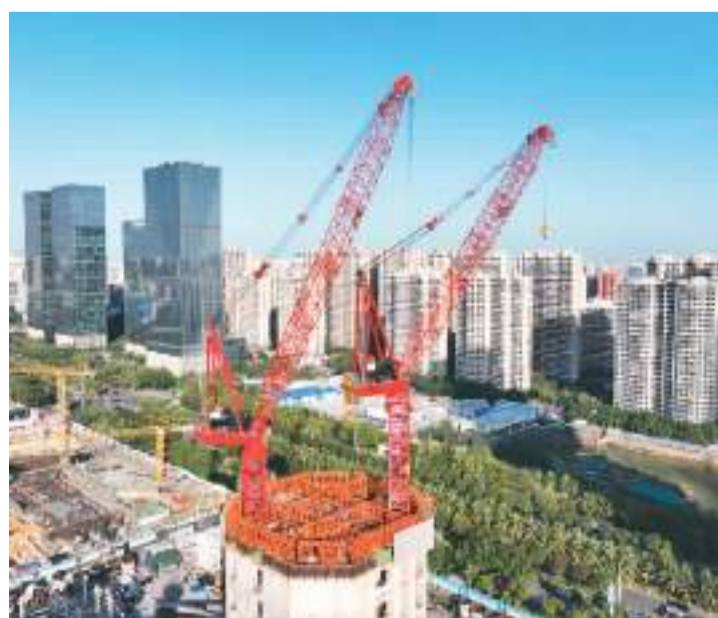
由中建三局承建的海南中心项目位于海南省海口市琼山区国兴大道南侧，是集观光、酒店、写字楼、商业等多功能于一体的超高层综合体。图为工作人员操作塔吊施工。

与圆通科学工作站项目建设标准》。来自北京大学、西安交通大学、国家开放大学等单位的多名专家学者围绕做大做强产教融合项目、持续推广岗位微专业改革、大力培养应用型人才培养、促进大学生高质量就业等主题交流了看法。