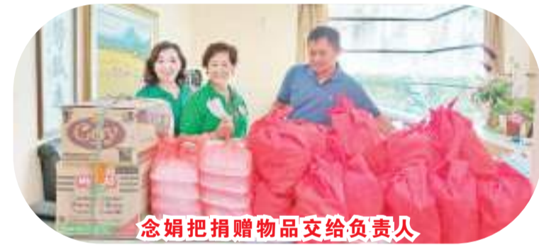
念娟把捐赠物品交给负责人