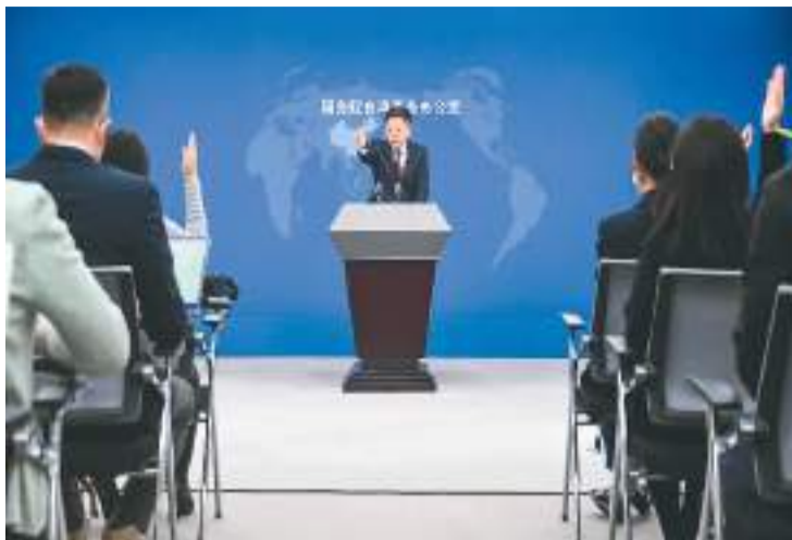
图为国台办发言人马晓光邀请记者提问。新华社记者 陈晔华摄

他介绍说，2022年，两岸文化、教育、科技、卫生、体育、基层、青年、少数民族、宗教和民间信仰等领域、各界别持续举办各类交流活动，全年累计超过1000场次。交流活动呈现多主题、多层次、多形态特点，充分体现两岸各领域交流的