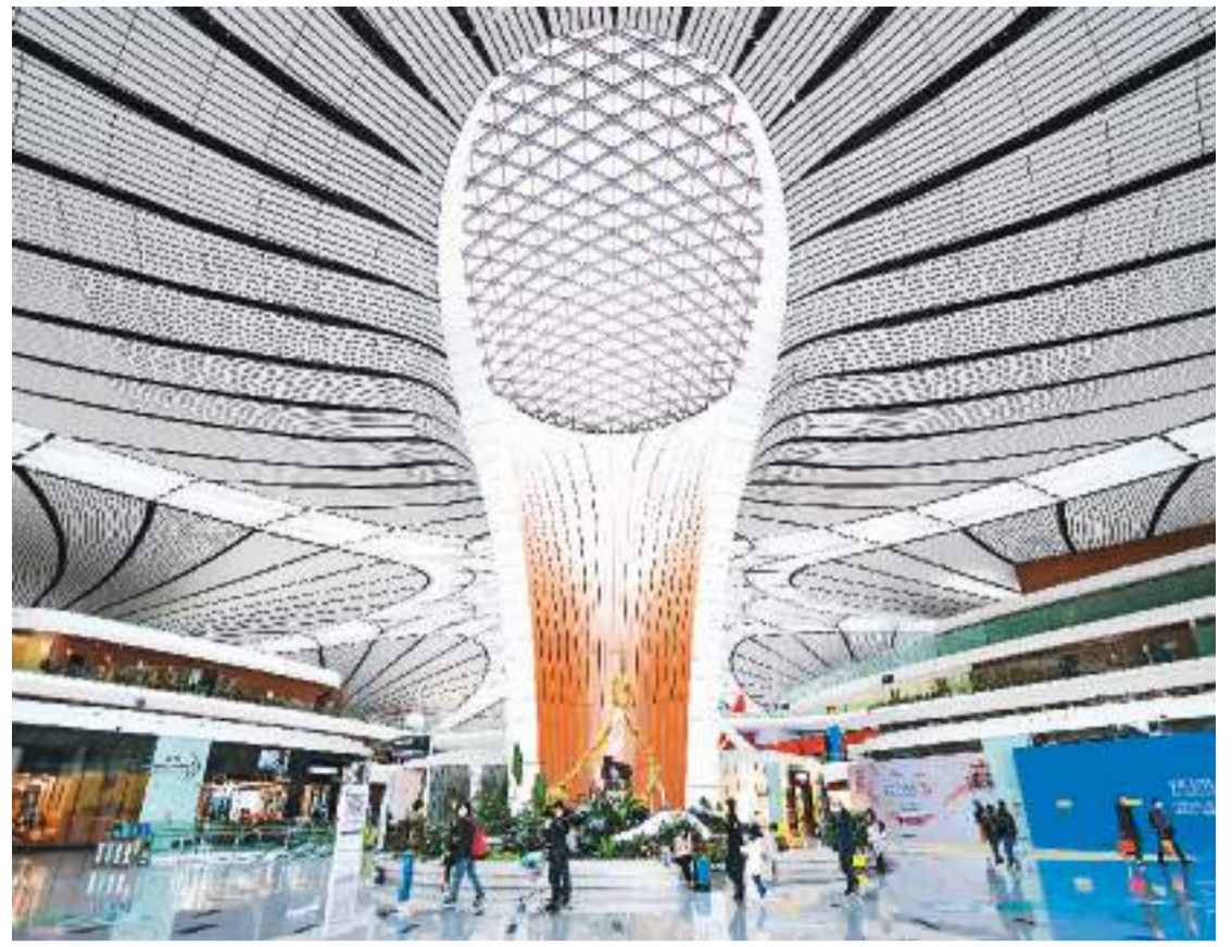
1月7日，在北京大兴国际机场航站楼内，乘客步行前往登机口。