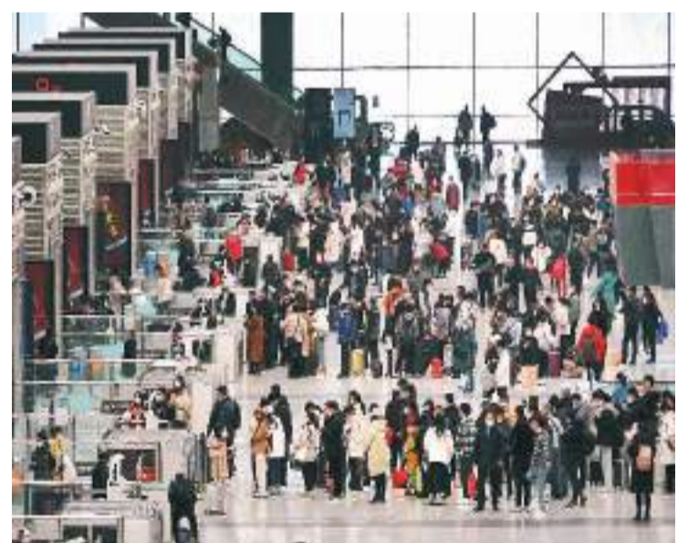
1月7日，旅客在郑州东站候车大厅内等候。

新华社文章表示，2023年春运，在回归的烟火气中开始，也开启了许多人新一年的记忆和期盼。新的一年，必将更加充满活力。