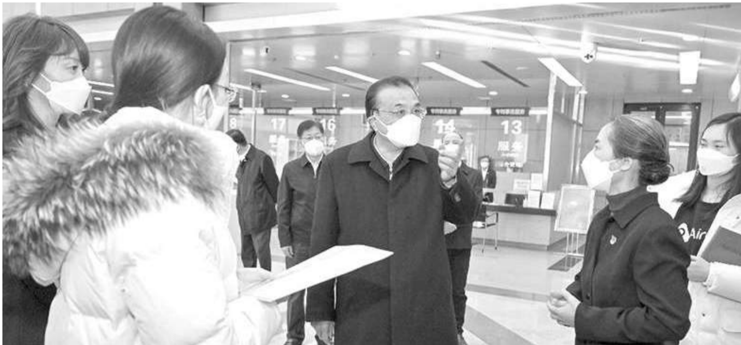
1月9日，中国国务院总理李克强到市场监管总局考察，并主持召开座谈会。这是李克强在知识产权局考察。

新华社北京1月13日电 记者13日从商务部获悉，中国商务部部长王文涛12日视频会见美中贸易委员会会长艾伦。双方就中美经贸关系、中国扩大开放等议题交换了意见。王文涛指出，希望美方正确看待中国发展给美国、给世界带来的机遇，按照两国元首指明的方向，推动中美经贸关系早日重回正轨。