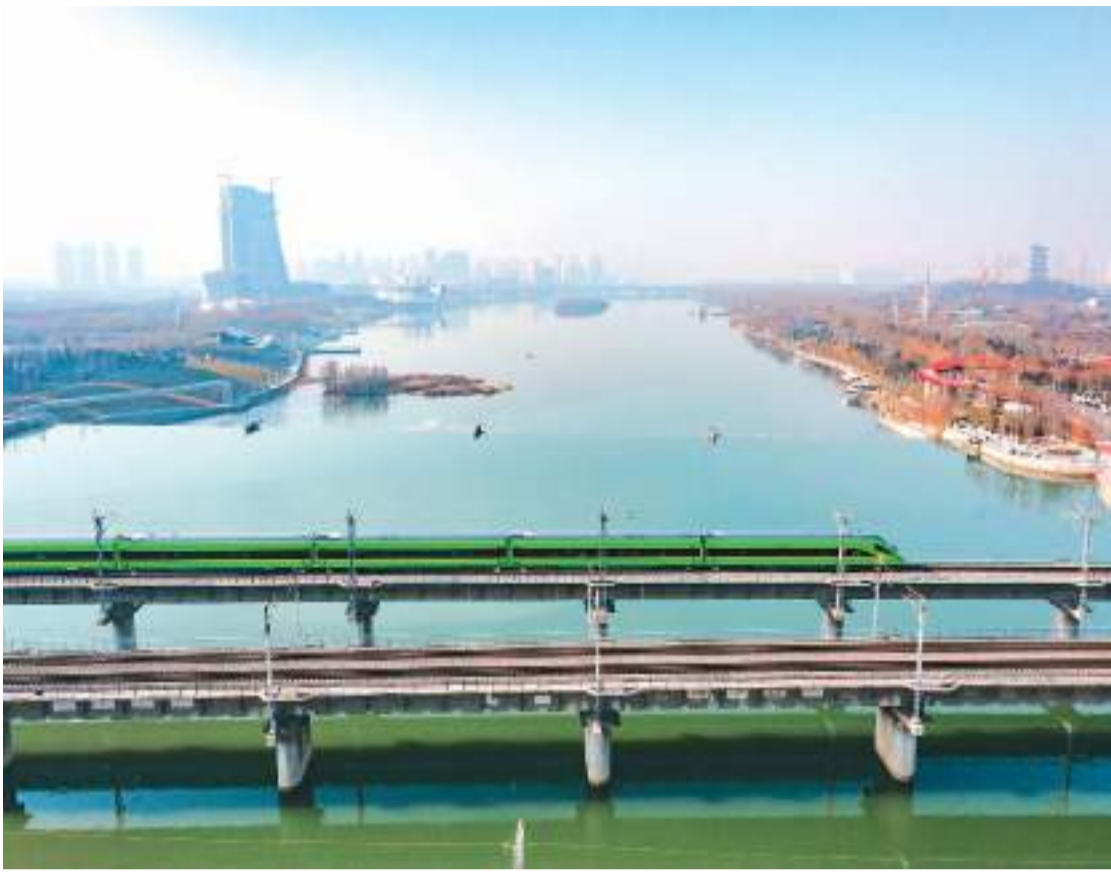
1月7日，从西安站始发的“复兴号”动动车组正在行驶中。