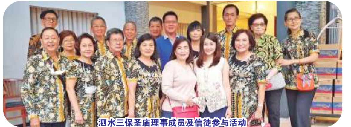
泗水三保圣庙理事成员及信徒参与活动