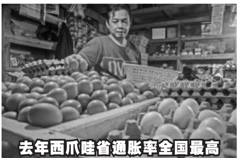
去年西瓜哇省通胀率全国最高

他补充说：“为了保持人们的免疫力仍然很高，并保护人们免受新冠病毒的侵害。”(Irw)