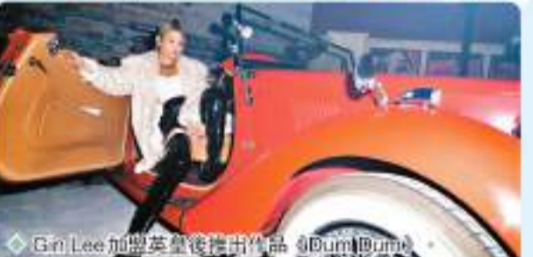
Gin Lee 加盟英皇後推出作品《Dum Dum》。

為復工加操體能 除此之外，由於是跳唱歌曲，Gin Lee 每日均花3至4小時練習，希望可以掌握每個動作細節。她表示：「到現在係有信心去做每一個動作，成個過程我會覺得係好容易，但係我好 enjoy，雖然我好鍾意跳舞，但唔係由細去學，所以我需要將勁補強。」向來追求盡善盡美的 Gin 除了跳舞，就連自己身形都不放過，「特意加操體能，之前放假食多啲，知道正式復工，就在操自己，跳舞，做 gym，要以最佳姿態示人。」