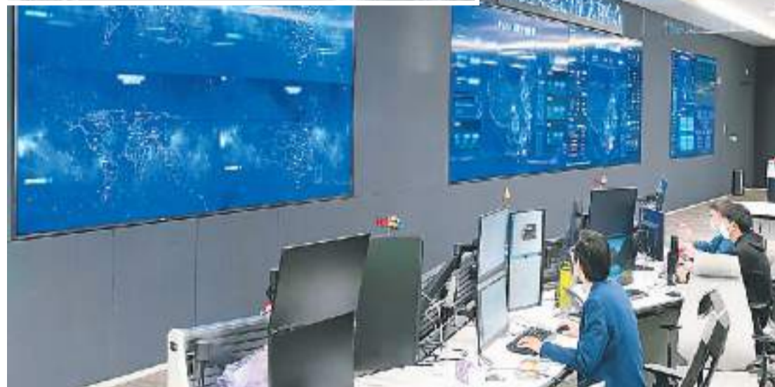
▼在位于广东深圳的腾讯全球基础设施运营中心，技术人员对数据中心进行集中统一管控。