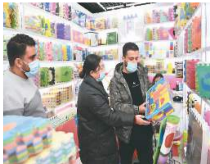
近来，浙江省义乌市外商逐渐回流。义乌市公安局出入境管理局的数据显示，截至目前，义乌常驻外商已超万人。图为1月11日，外国客商（右）在义乌国际商贸城选购玩具。

去年全年，我国社会融资规模增量累计为32.01万亿元，比上年多6689亿元。其中，对实体经济发放的人民币贷款增加20.91万亿元，同比多增9746亿元。截至2022年末，我国社会融资规模存量为344.21万亿元，同比增长9.6%。其中，对实体经济发放的人民币贷款余额为212.43万亿元，同比增长10.9%。