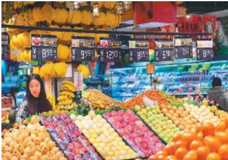
1月12日，顾客在贵州省从江县一家超市选购水果。

国家发展改革委价格司副司长牛育斌介绍，2022年，全年CPI中的食品价格指数上涨2.8%；在国际市场小麦、玉米价格月度同比涨幅最高达到74%和36%的背景下，中国小麦、玉米价格走势平缓，成品粮零售价格稳定，全年36个大中城市大米零售价比上年下降1%，面粉零售价比上年上升3%。