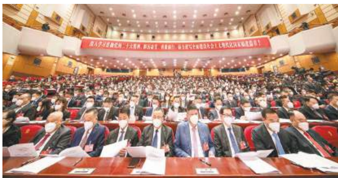
委員們認真審議各專門委員會工作報告。

組織開展重點課題調研。開展《閩產藥材「福九味」保護利用》《福建寺廟醫藥文化遺產保護和發展》《開展台灣姓氏源流研究及成果轉化推動閩台文化園建設》等10餘項重點課題調研活動，內容涵蓋文化遺產保護、中醫藥保護開發利用、戲曲傳承保護等領域，提出富有建設性的意見和建議，為福建文化和民生事業發展作出政協貢獻。