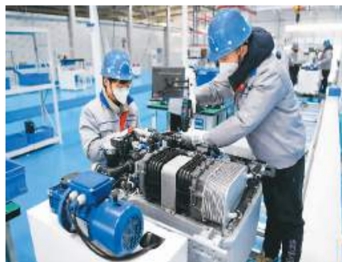
东旭氢能电机装备产业园项目是河南省洛阳市大力发展氢能产业的标志性工程。目前，该项目氢燃料电池发动机项目生产厂房已全部建成，生产设备已调试完成，并开始试生产。图为该项目氢燃料电池发动机生产车间内，工作人员正在生产线上组装氢燃料电池发动机。

据介绍，引入境外交易者首日，共有来自新加坡、印度尼西亚等国家和地区的26家境外客户参与菜籽油、菜籽粕、花生期货和期权交易。