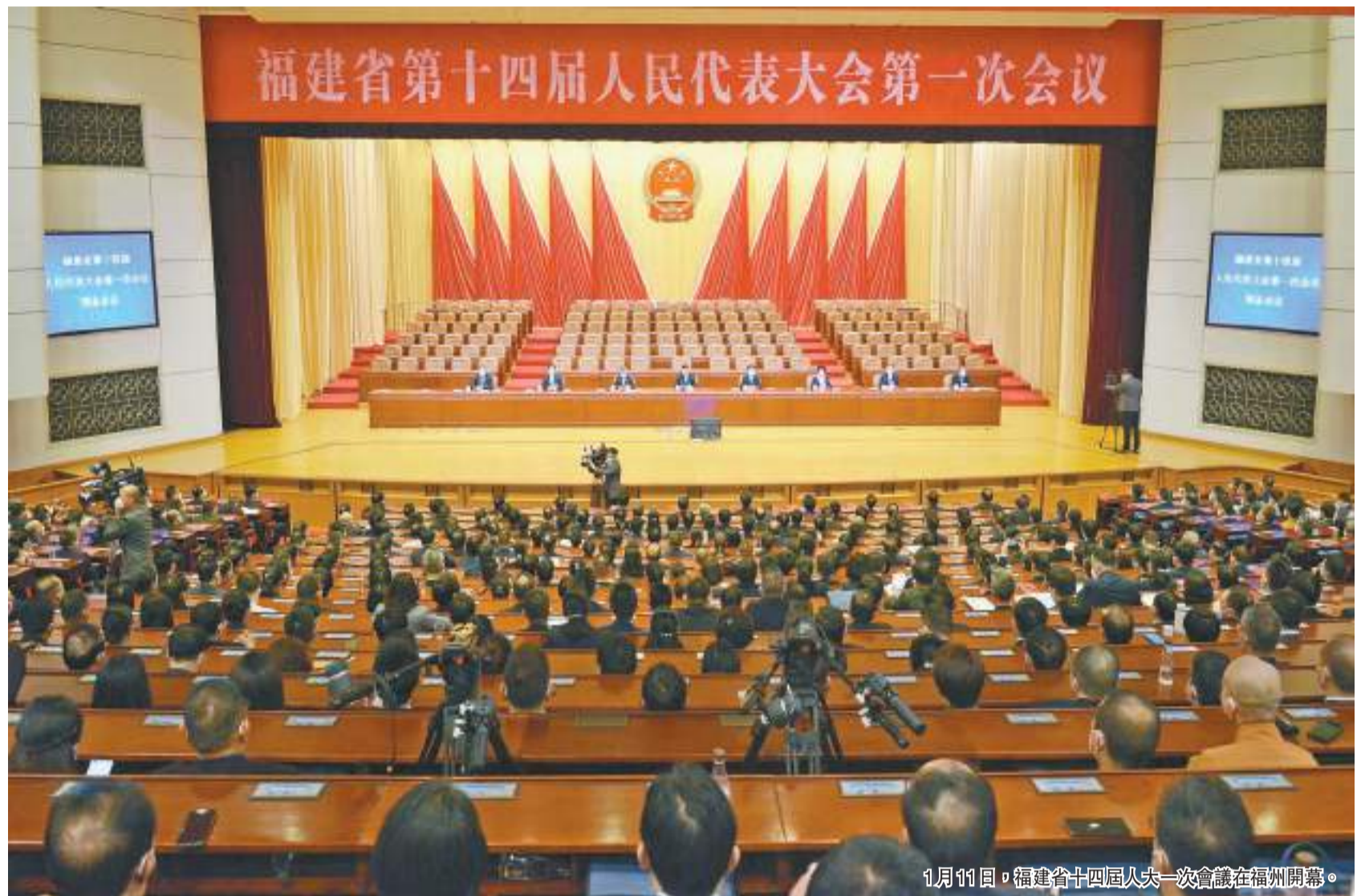
1月11日，福建省十四屆人大一次會議在福州開幕。

1月11日，福建省十四屆人大一次會議在福州隆重開幕。肩負全省人民的重託，來自全省各條戰線、各行各業的省人大代表，滿懷豪情、步伐堅定地走進福建會堂，以飽滿的政治熱情和高度的責任感出席大會，依法履行神聖職責。