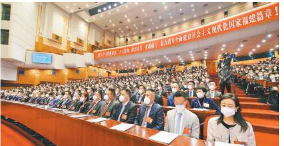
圖為大會現場。