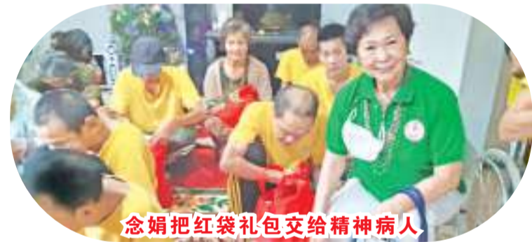
念娟把红袋礼包交给精神病人