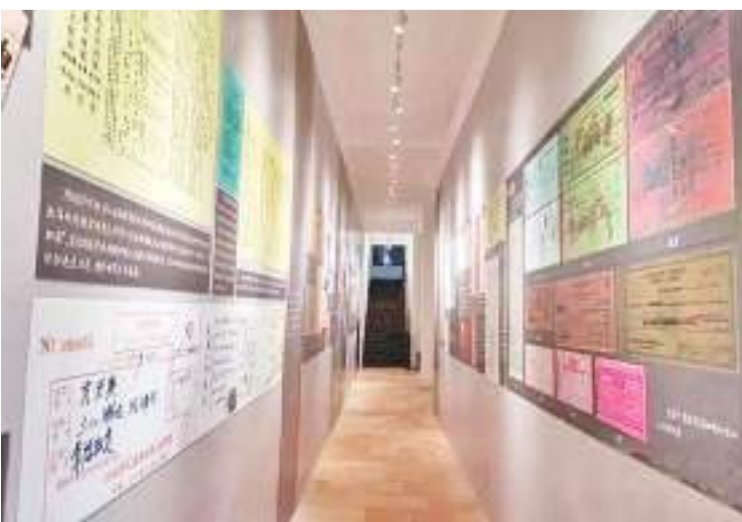
江门台山银信博物馆展出的部分侨批。

家大院(原名汀江圩)、冈宁圩(电影《让子弹飞》“鹅城”取景地)。海外华侨推动了侨乡由传统农业社会向工业社会转型,这成为民国时期乡村建设实践和探索的一个独特类型。