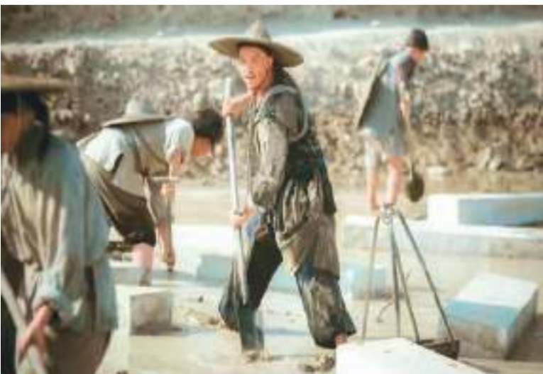
▲电视剧《天下长河》剧照。