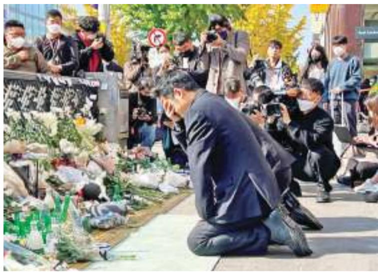
当地时间2022年10月31日，韩国首尔市龙山区梨泰院站1号口，汉密尔顿酒店楼下，民众送来鲜花和祭品悼念遇难者。

中新网1月13日电 据韩国国际广播电台(KBS)13日报道，韩国警察厅梨泰院事故特别调查本部自成立74天后结束调查，发布了最终调查结果。