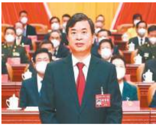
周祖翼宣布福建省十四屆人大一次會議開幕。