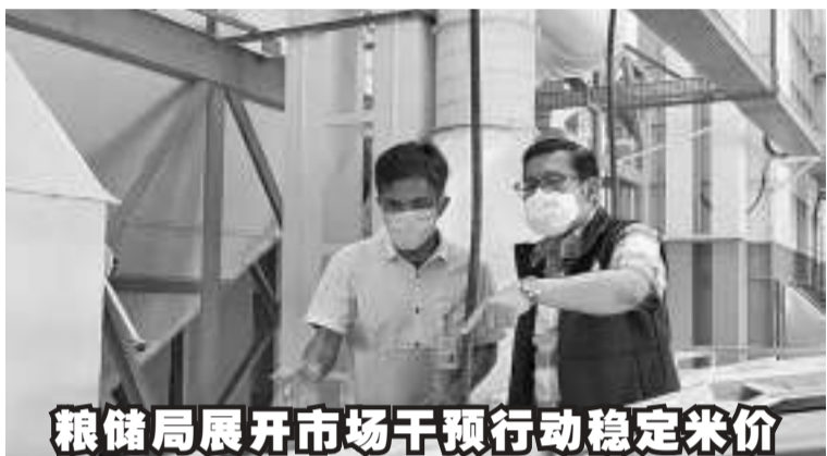
粮储局展开市场干预行动稳定米价

为稳定市场的米价，国家粮食机构大量分配了粮储公共公司大米。图为国家粮食机构主任阿里夫(Arief Prasetyo Adi/右)在粮储局的仓库里，正查看稻谷和稻米质量的情景。