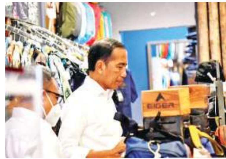
佐科维总统(左二)视察市场。

他说:“我在商场里转了一圈,看看商店橱窗里陈列的产品,我也顺便去商店买了毛衣和背心等,我买的全是国产品。”