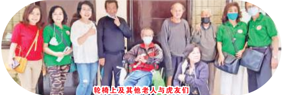
轮椅上及其他老人与虎友们