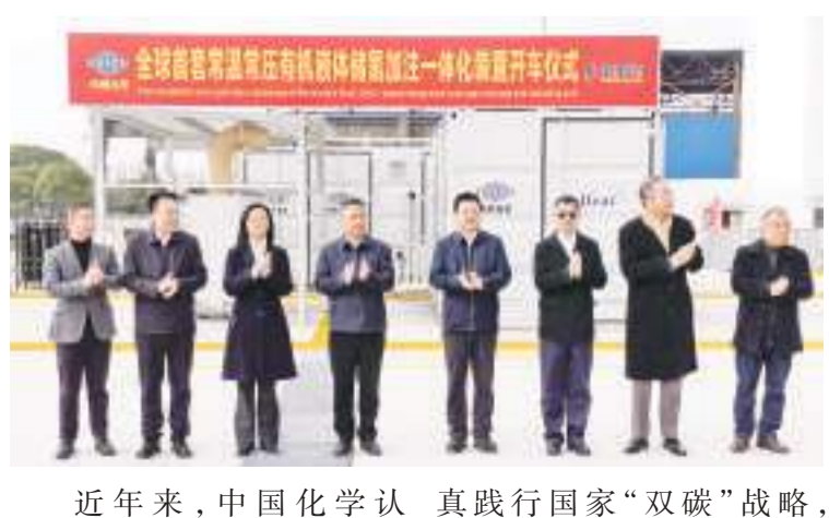
近年来，中国化学认真践行国家“双碳”战略，

【本报讯】1月11日上午10时，由中国化学建投公司投建的全球首套常温常压有机液体储氢加注一体化装置在上海金山碳谷绿湾举行开车仪式。 本装置共包含五个系统：氢油加注及储油回收系统、400kg/天撬装氢油脱氢系统、固定式质子交换膜燃料电池供电系统、氢气加压至12.6MPa系统、45MPa氢气加注系统。