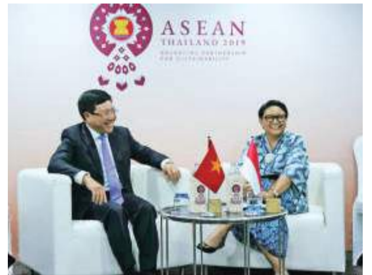
2019年7月30日,外长蕾特诺与越南时任外交部长范平明(左)会晤。

【本报讯】外交部长蕾特诺表示,2022年,我国继续与邻国谈判领土边界。取得成功的领土边界谈判之一是关于我国与越南的专属经济区的边界协议(ZEE),有关边界会谈经过12年的艰苦讨论而结束。