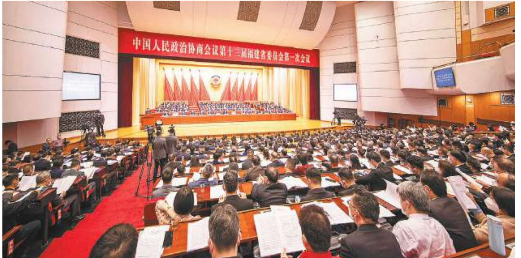
1月10日上午，中國人民政治協商會議第十三屆福建省委員會第一次會議在福州隆重開幕。

立足新發展階段，貫徹新發展理念，服務新發展格局，以推進生態文明建設、助力福建綠色低碳發展、促進人與自然和諧共生為主題。不斷完善協商格局，拓展協商深度，提升協商質量，跟蹤落實轉化高質量的協商議政成果。