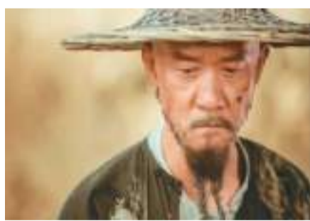
▲电视剧《天下长河》剧照。

本报电(记者张鹏禹)在中国书刊发行业协会指导下，《2022年图书零售市场年度报告》(下称“《报告》”)近日在京发布。《报告》显示，2022年我国图书零售市场码洋规模为871亿元；短视频电商零售图书码洋同比上升42.86%，码洋占比赶超实体店，成为新书首发重要渠道；从整体图书零售市场前100名非主题出版类新书的销量分布来看，有43种新书在短视频电商的销量占比超过50%。 《报告》由北京开卷信息技术有限公司基于图书零售市场观测系统数据分析完成。数据显示，从2022年各类图书的码洋构成看，少儿类是码洋比重最大的类别，且码洋比重进一步上升；教辅类码洋比重位居第二；文学类码洋比重增幅最大。在近两年的新书中，原创图书占比在提升，原创新书品种占比从23.9%上升至24.5%，原创新书码洋占比从23.7%上升到30.1%。2022年文学、少儿、学术文化和经济与管理类原创新书品种较多，均在6000种以上。