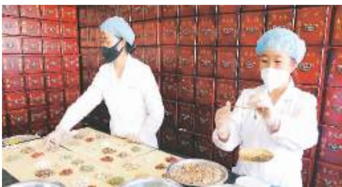
1月9日，山东省东营市东营区文汇街道一中医馆药师在配制中药方剂。

“经过三年疫情防控，我们形成了中西医结合、中西药并用的中国方案，中医药在其中发挥了重要的作用。”北京中医医院院长刘清泉介绍，在应对新冠的过程中，中医中药利用其简、便、验、廉的特点，迅速找出核心病机，制定了针对轻型、普通型、重型和危重症的治疗方案。对于轻型、普通型患者，中医药进行治疗可以缩短病毒清除时间，缩短住院时间，缓解临床症状。对于有可能转重的患者，及早进行中医药的干预治疗，可以降低转重率。对于重型、危重症的患者，开展中西医结合治疗，可以有效阻断或减缓重症向危重症的发展，促进重症向轻型的转变，减少死亡率。