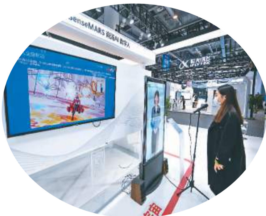
参观者在首届全球数字贸易博览会现场体验数字人技术。