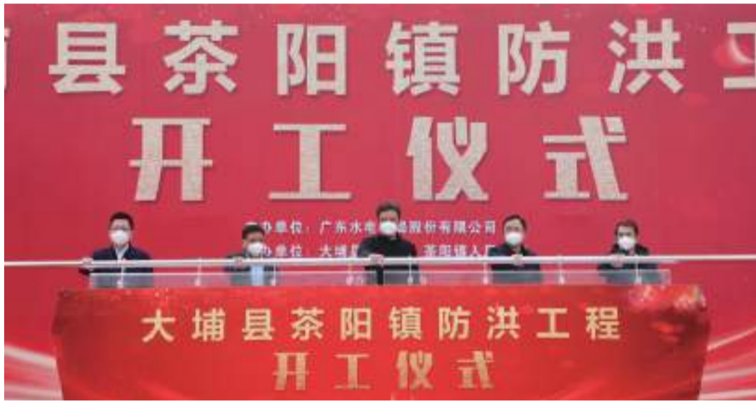
梅州日報訊(記者洪國棟 特約記者餘瀟瀟 羅文燕)省重點工程項目——大埔縣茶陽鎮防洪