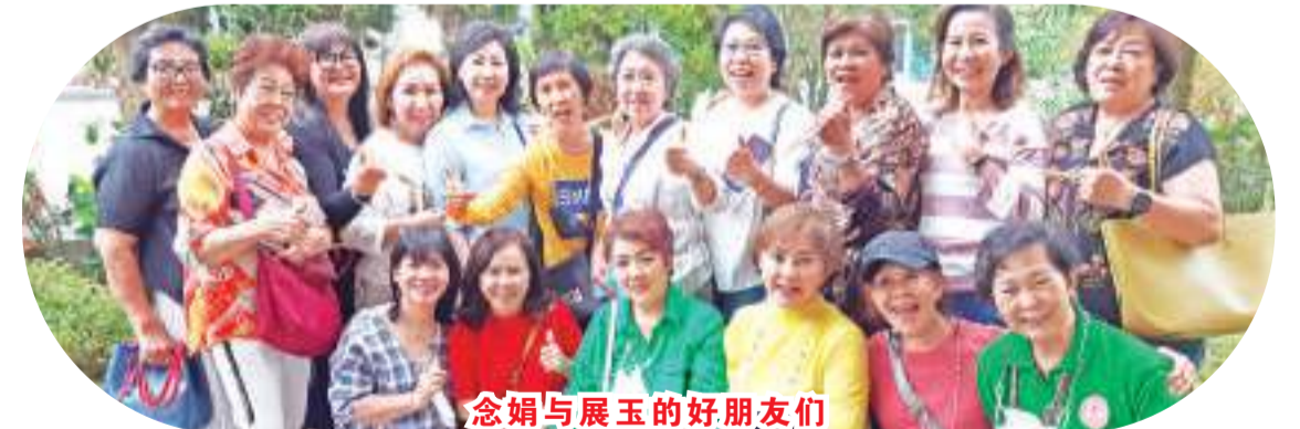
念娟与展玉的好朋友们