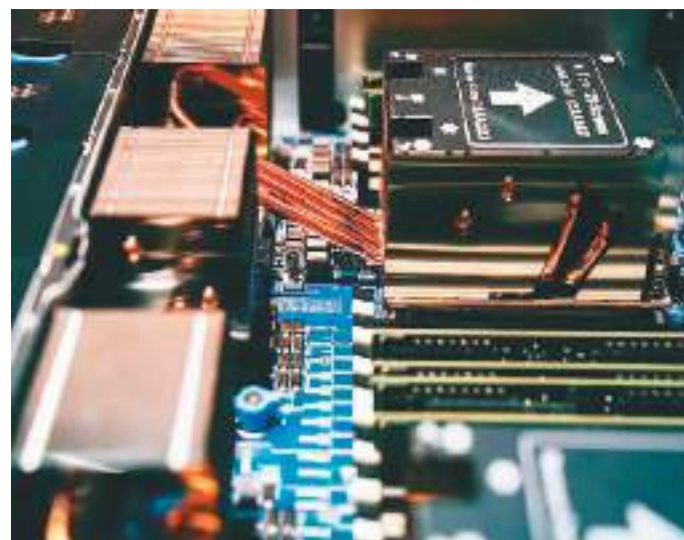
类云场景下对算力的需求。

占全国GDP近四成的数字经济，还将中国技术和中国产品带上海外市场大舞台。国产“数据粮仓”长啥样？它们是如何建设运营的？在海外市场表现如何？