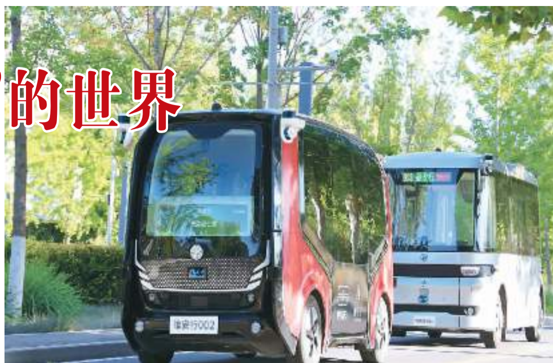
自动驾驶交通工具在雄安新区进行测试。

业内人士认为，未来产业不面向已知需求开展研发，还需要突破性的创意和颠覆性的技术创新，其发展路径表现为科技创新、模式试错与市场需求之间持续的互动升级。因此，未来产业的投入更大、回报周期更长，孵化起来不仅需要耐心，还要建立起良好的产业生态系统，尽快打破影响技术、人才、资本、数据等要素自由流动的壁垒，充分挖掘创新潜力，利用中国超大规模市场的优势，不断培育未来产业新需求。