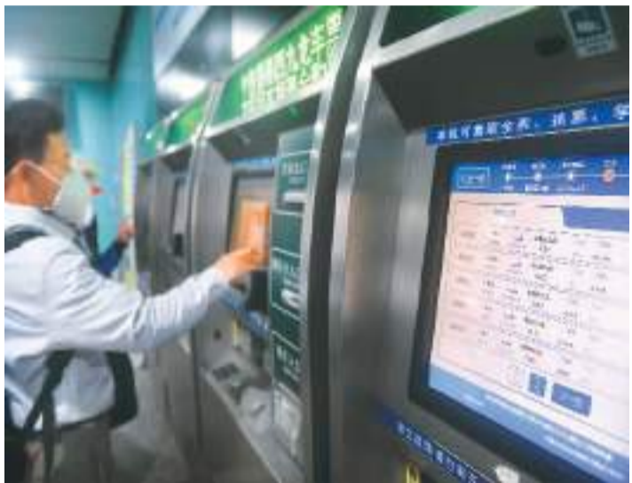
图为1月12日，乘客在广州东站售票厅购票。新华社记者 卢汉欣摄

特区政府发言人说，特区政府一直与内地相关部门及铁路营运单位紧密沟通和协调，确保车站、列车、有关配套及人手安排准备稳妥。其中，港铁公司与国铁集团和广铁集团在1月8日起安排列车试运行，让香港和内地车长及工作人员熟悉有关程序及跨境路况，并测试系统运作。香港纪律部队11日早于高铁西九龙口岸进行演练，确保通关初期口岸运作畅顺。