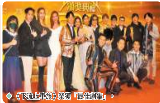
《下流上車族》榮獲「最佳劇集」。