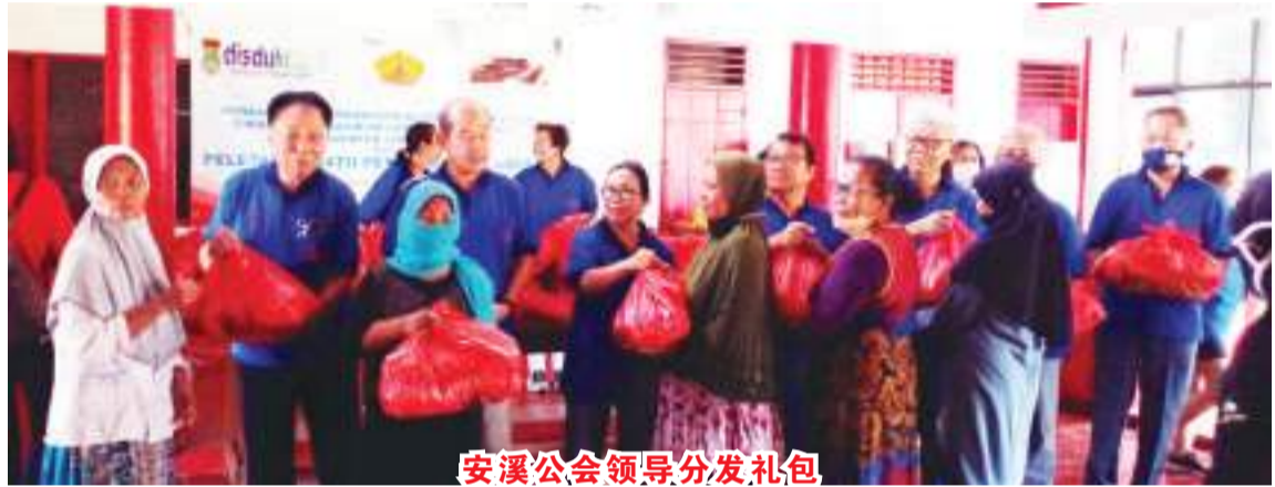
安溪公会领导分发礼包