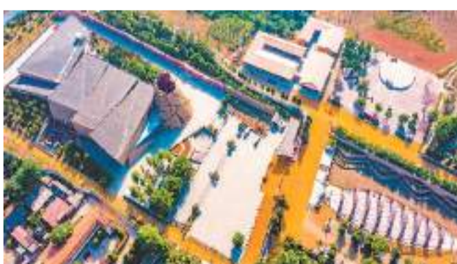
仰韶村国家考古遗址公园。

仰韶村国家考古遗址公园将仰韶文化博物馆、考古发掘纪念点等景观串点连线，形成了“一中心两环三广场四点五园”的展示结构。