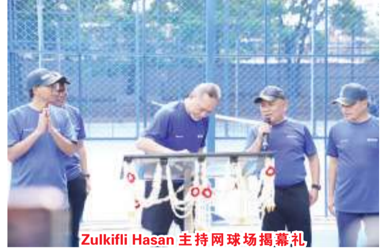
Zulkifli Hasan 主持网球场揭幕礼

这是新冠疫情大流行两年后的首次公开活动，数千名员工和贸易部一、二梯队官员踊跃参与。贸易部长 Zulkifli Hasan 在讲话中希望贸易部员工团结一致，以便他们能够成功