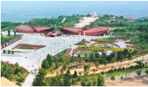
泥河湾国家考古遗址公园外景。

泥河湾国家考古遗址公园目前已建成泥河湾研究中心、马圈沟等重点遗址保护展示棚、游客服务中心、泥河湾考古遗址公园等研究和保护利用设施。