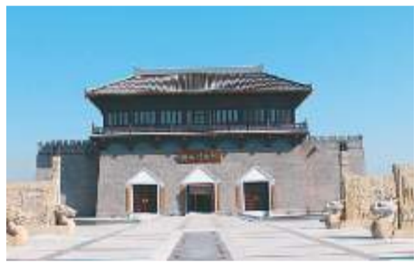
邺城博物馆已成为邺城国家考古遗址公园组成部分。

赵王城国家考古遗址公园规划总面积534公顷，由遗址展示区和文化展示区两部分组成。