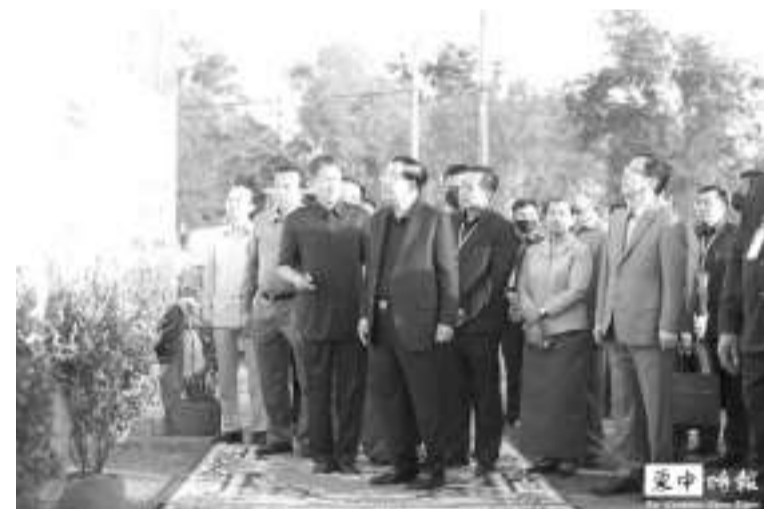
洪森9日出席柬埔寨7号公路斯昆至磅湛段升级改造项目开工典礼期间的画面。

据央视新闻此前报道，2021年5月20日，在参加由日本经济新闻社主办的第26届亚洲未来国际会议开幕式时，面对日方提出的关于国际社会担忧，柬埔寨太过于依赖中国的问题时，洪森斩钉截