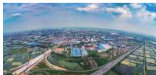
▲肇慶高新區鳥瞰圖

完善常態化黨政企溝通機制，健全領導掛鉤聯系服務企業制度，打通服務企業“最後一公里”，確保“肇慶服務、天天進步”。