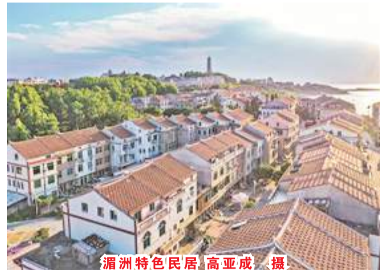
湄洲特色民居

三十载筚路蓝缕,三十岁风华正茂。2022年是湄洲岛建区30年,30年来,湄洲岛的战略构想与建设愿景渐次清晰。从“偏僻荒凉”的湄洲乡到国家旅游度假区、国家级风景名胜、国家级海洋公园、国家5A级旅游景区以及中国首个信俗类世界非遗所在地;从“一地三岛”到将建成人文浓郁、特色鲜明、设施完善、功能完备、生态优美的世界妈祖文化中心、国家旅游度假区、国际旅游度假目的地和全国对台交流合作重要基地。