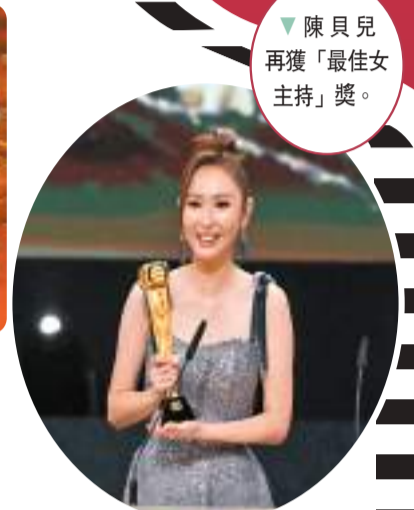
陳貝兒再獲「最佳女主持」獎。