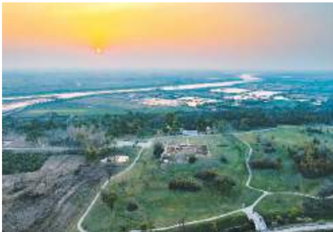
凌家滩国家考古遗址公园。

凌家滩国家考古遗址公园已完成考古研学基地、遗址陈列馆、遗址核心展示区、游客服务中心等项目，正筹备推进凌家滩博物馆建设。