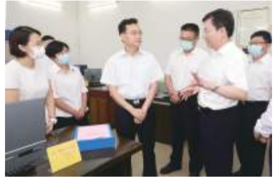
▲張愛軍到基層調研(資料圖)

黨的二十大精神進機關、進企業事業單位、進城鄉社區、進校園、進軍營、進各類新經濟組織和新社會組織、進網站。同時，持續開展“入戶訪民情、暖心大走訪”活動，邊走訪邊宣講、邊走訪邊解難，真正把黨的二十大精神送到基層、送到群眾身邊。滾動開展“肇慶深調研”，優化完善“我為肇慶抓發展”思路舉措，推動黨的二十大精神在肇慶轉化為有形、有感、有效的舉措和成效。