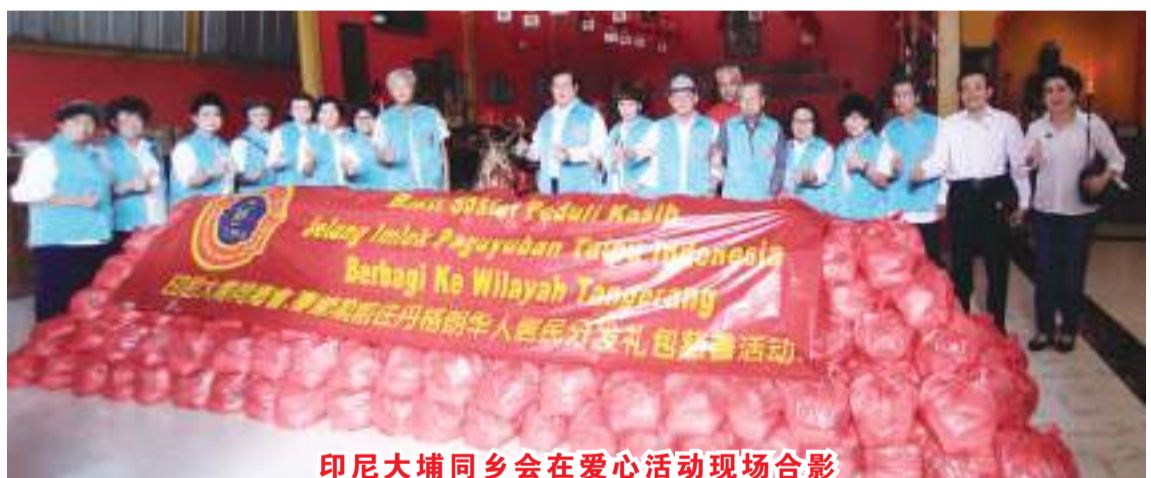
印尼大埔同乡会在爱心活动现场合影