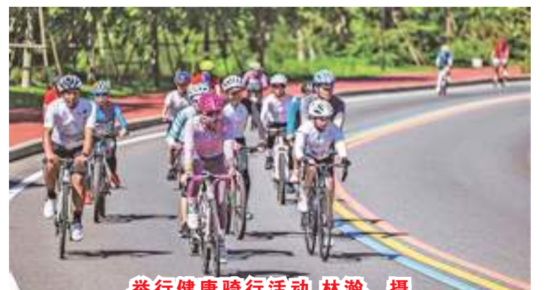
举行健康骑行活动