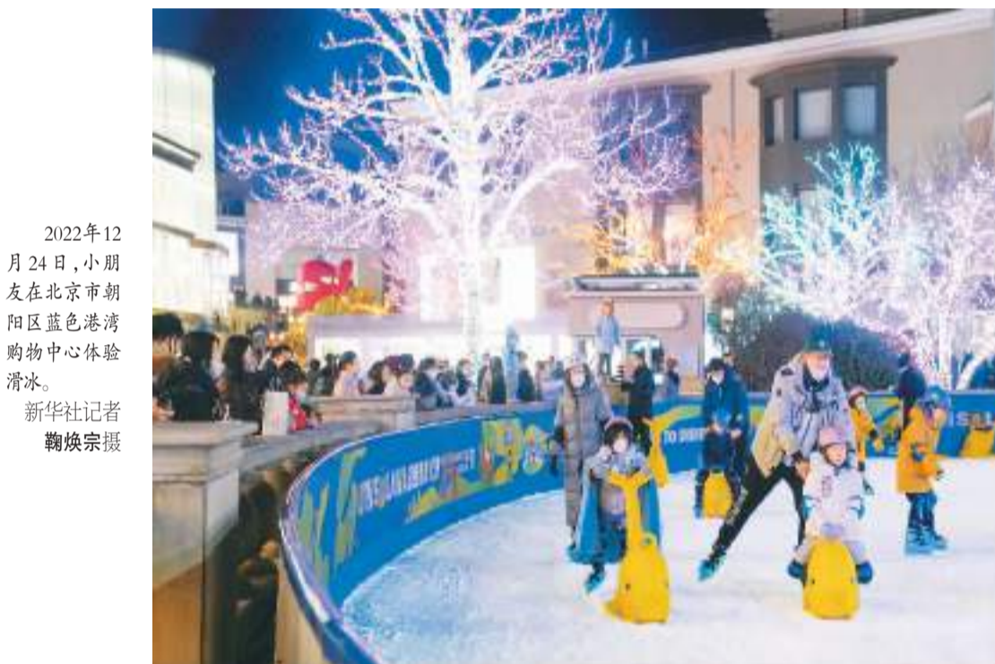
2022年12月24日，小朋友在北京朝阳区蓝色港湾购物中心体验滑冰。