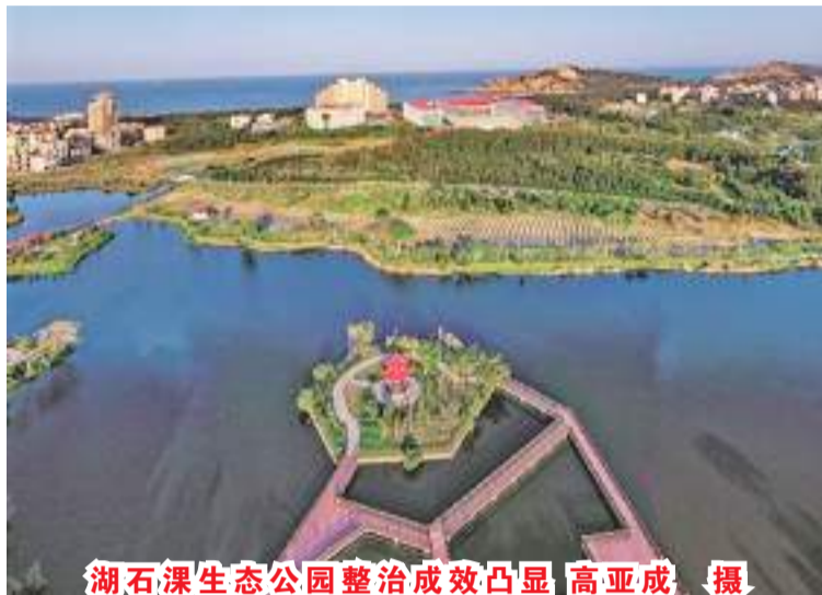
湖石潭生态公园整治成效凸显