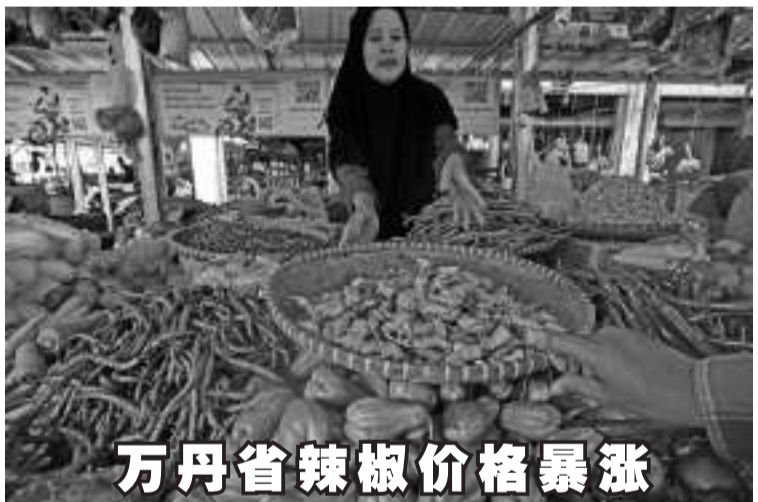
万丹省辣椒价格暴涨

提交年度报税表是强制性的。换句话说, 如果太迟提交或不报的话, 您将受到罚款乃至监禁的制裁, 这也是根据一般税收规定法实行的。