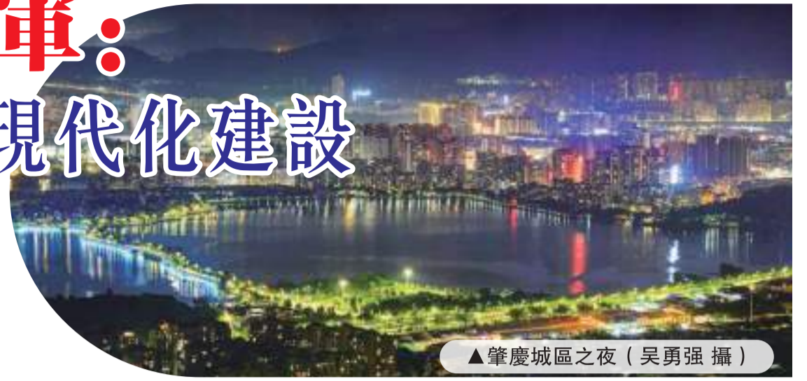
▲肇慶城區之夜