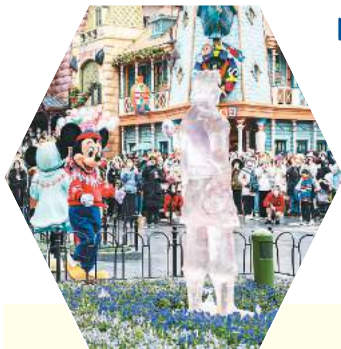
图为1月2日的上海迪士尼乐园，游客观看圣诞舞表演。

这个新时代，不仅因为中国有全球最大的旅游客源市场以及竞争力、创新力、影响力持续增长的旅游市场主体，还因为有人类命运共同体理念指引下的全球旅游治理的中国方案。中国在为世界旅游发展贡献市场、资源的同时，也贡献了中国旅游发展的丰富经验。中国旅游业与世界旅游业相互吸引、相互作用、相互支撑。未来，中国必将在世界旅游发展中发挥越来越重要的作用，扮演越来越关键的角色。（本报记者 严瑜采访整理）