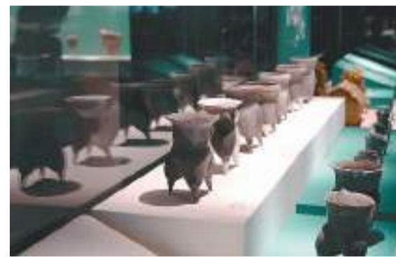
郑州商城国家考古遗址公园内，展出青铜器、玉器、骨器、陶器等文物1000余件。

郑州商城国家考古遗址公园由郑州市商城遗址保护管理处管理运营，将“片段化”的现存遗址进行“线”“面”整合，打造了“宫殿区+内城垣”式的大遗址公园。