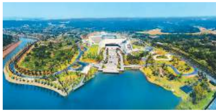
汉代海昏侯国国家考古遗址公园主要包括遗址博物馆、刘贺墓园、游客服务中心等。

民墓地为核心的一系列重要遗存构成，为研究汉代侯国建城制度、人文历史、社会经济等提供了全面的历史资料。