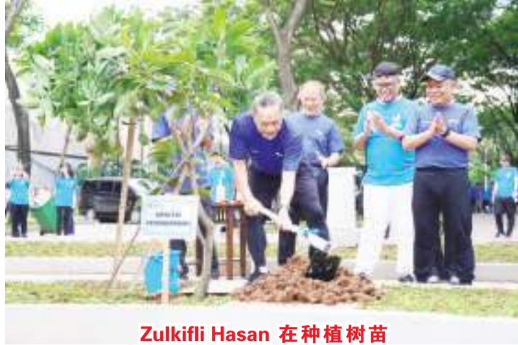
Zulkifli Hasan 在种植树苗

【本报讯】贸易部长 Zulkifli Hasan 在贸易部秘书 Suhanto 的陪同下，于 2023 年 1 月 6 日（星期