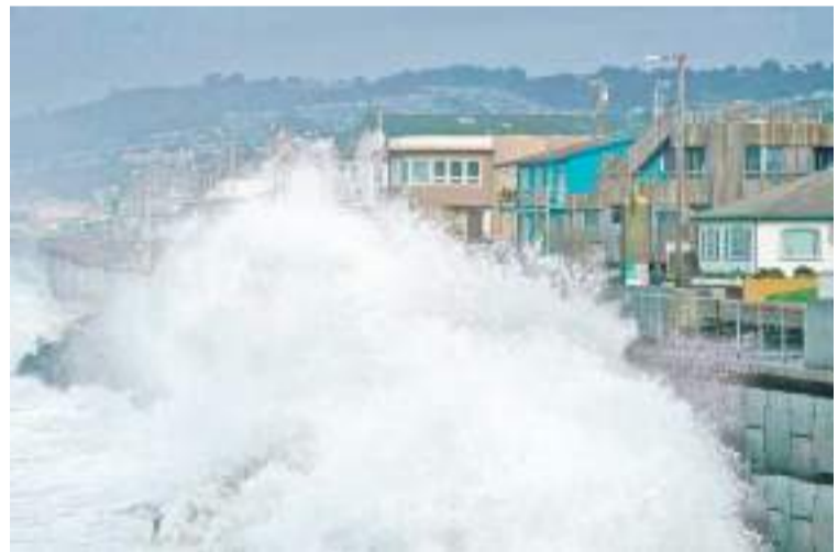
资料图：当地时间1月6日，海浪撞向加利福尼亚州帕西菲卡的防波堤。

美国国家气象局表示，飓风在太平洋上空增强，西海岸仍处于持续不断的飓风肆虐之下。该机构警告称，由于此前的降雨已经使地形饱和，进一步的暴雨可能会导致泥石流和河流水位的急速上升，使