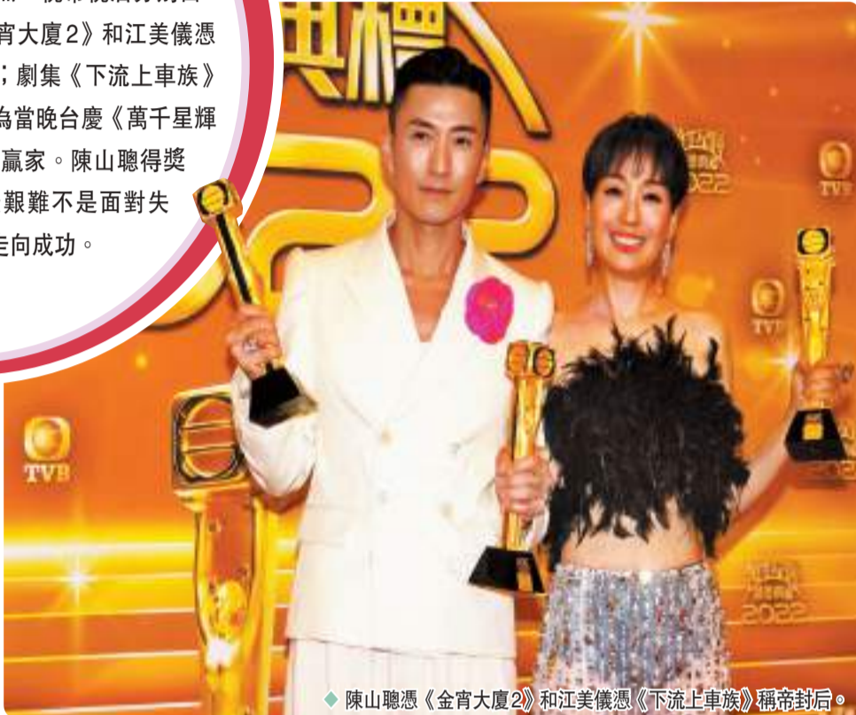
陳山聰憑《金宵大廈2》和江美儀憑《下流上車族》稱帝封后。

香港文匯報訊(記者梁靜儀、達里)無線《萬千星輝頒獎典禮2022》8日晚假香港將軍澳電視廣播城舉行,今年賽果激烈,視帝視后分別由大熱門陳山聰憑《金宵大廈2》和江美儀憑《下流上車族》榮膺;劇集《下流上車族》更成為最佳劇集,成為當晚台慶《萬千星輝頒獎典禮2022》的大贏家。陳山聰得獎致詞時表示,人生最艱難不是面對失敗,而是如何由失敗走向成功。