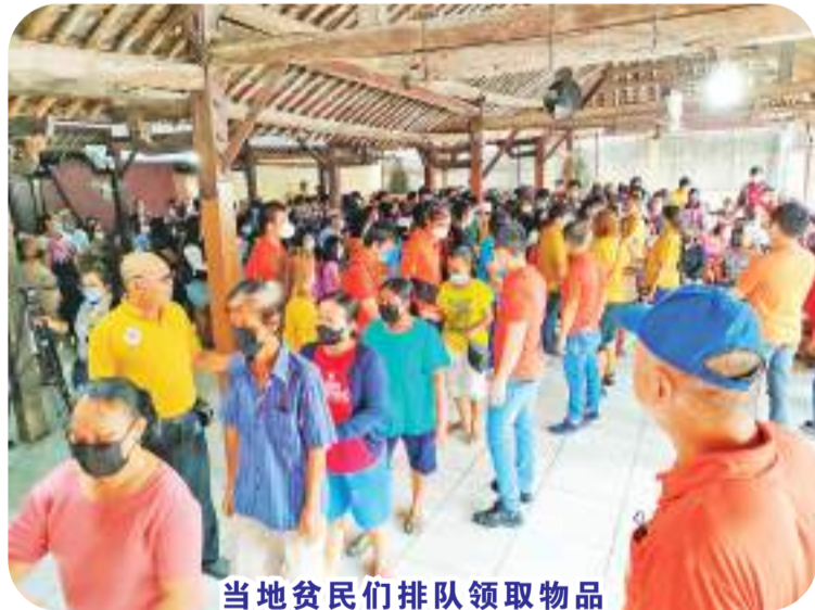
当地贫民们排队领取物品