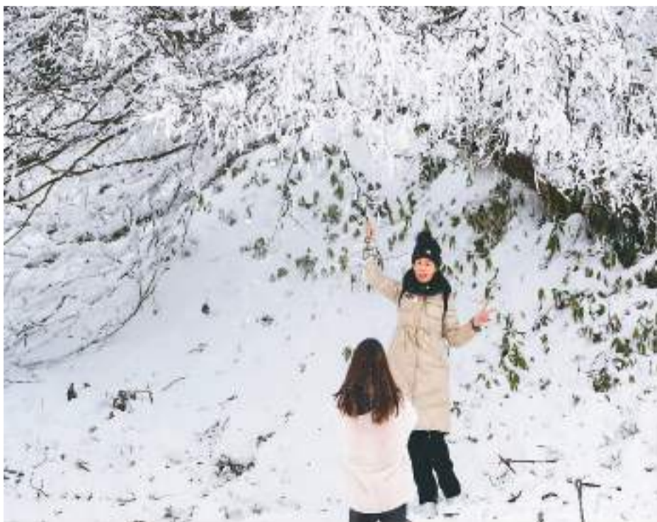
2023年1月1日，位于重庆市南川区的世界自然遗产地金佛山迎来降雪，吸引了众多游客前往。