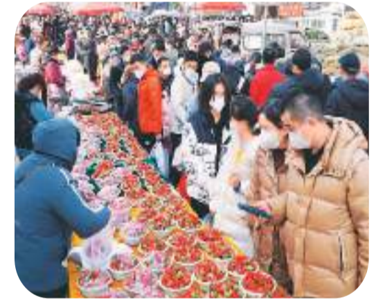
图为1月2日，在山东省济南市仲官街道的农村大集上，人们选购草莓。