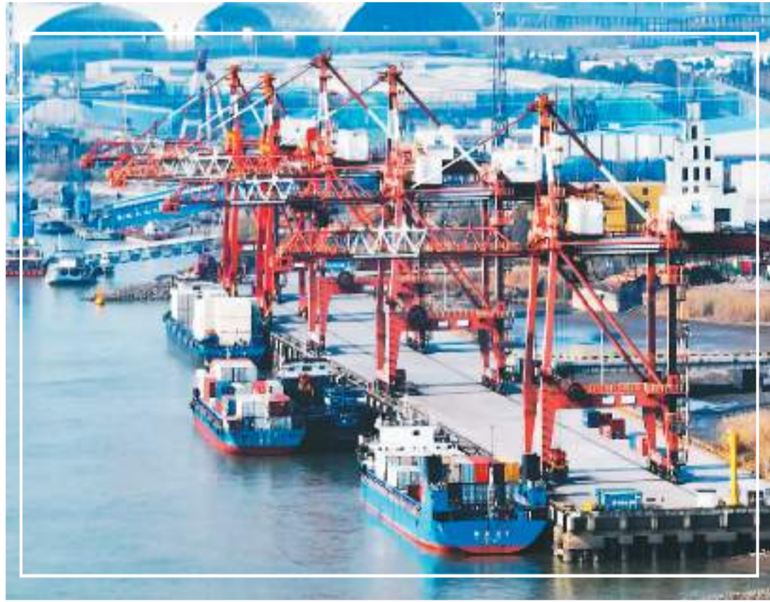
图为1月3日，在江苏省扬州港的集装箱码头，货轮停在泊位上装卸集装箱。