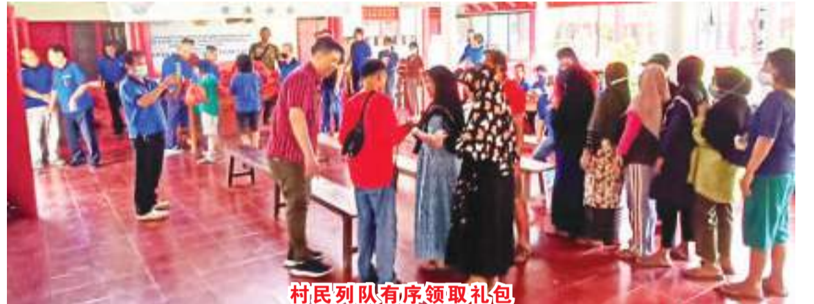
村民排队有序领取礼包