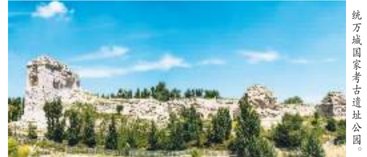
统万城国家考古遗址公园。

石峁国家考古遗址公园目前已建成考古工作站、外城东门遗址现场展示棚、游客服务中心等，遗址博物馆也已进入陈列展览施工阶段。