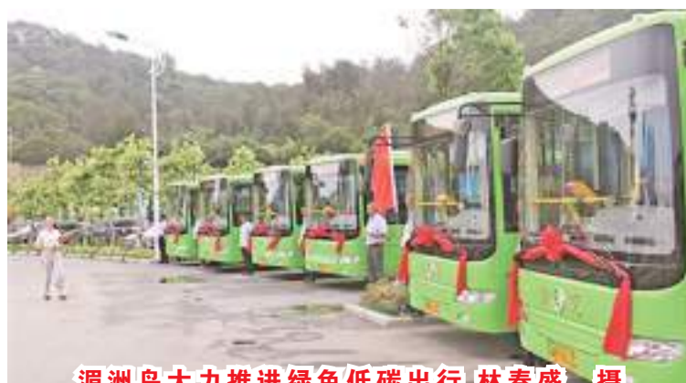
湄洲岛大力推进绿色低碳出行