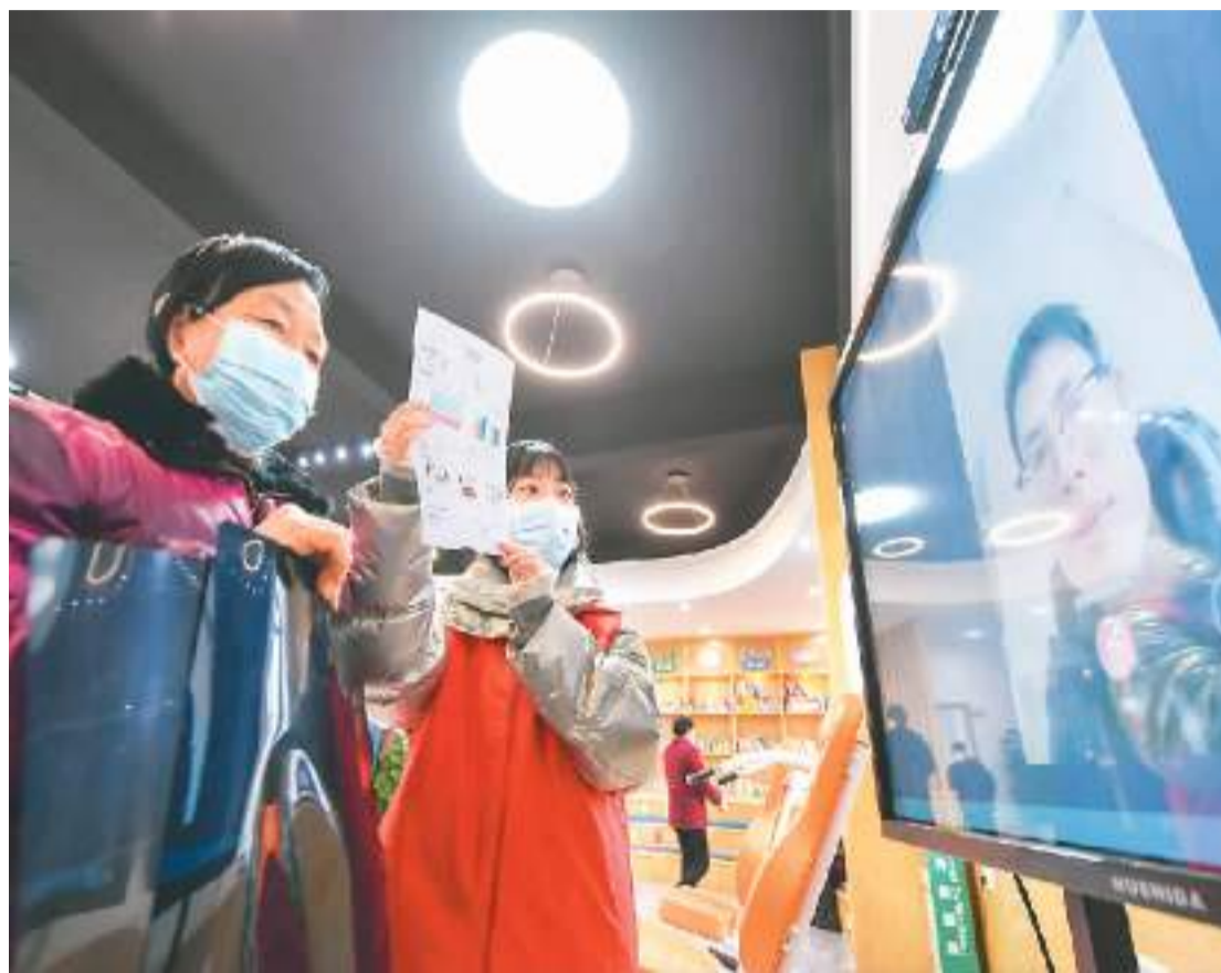
在浙江省湖州市长兴县画溪街道姚家桥社区区域型居家养老服务中心,志愿者指导老人使用远程问诊智能服务终端。

“岚山区搭建的智慧养老综合管理服务平台,汇聚全区养老数据,实时分配任务订单,为居家老年人提供助餐、