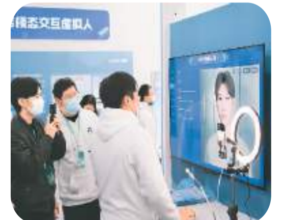
图为2022年11月17日，第五届世界声博会暨2022科大讯飞全球1024开发者节线下活动上，观众在了解“个性化3D虚拟人构建”产品。