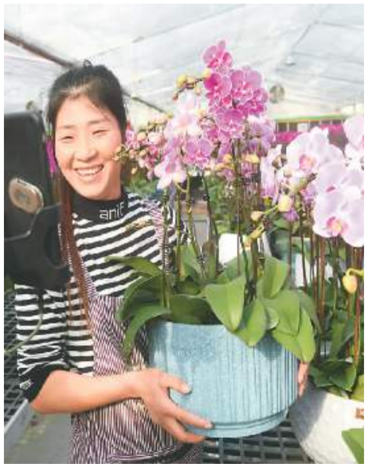
安徽省阜阳市颍上县南照镇姚岗村的花农在直播带货,通过网络平台销售蝴蝶兰。