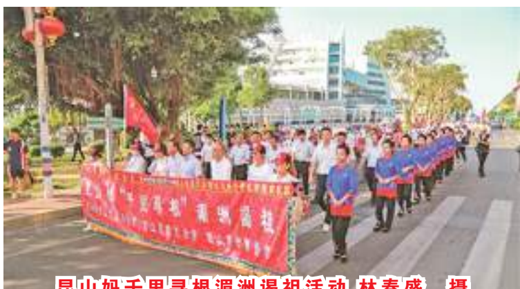
昆山妈千里寻根湄洲谒祖活动,林春盛 摄