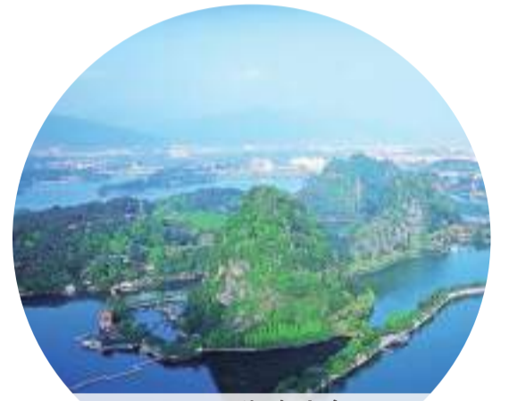
▲湖光山色 掩映中的肇慶

完善常態化黨政企溝通機制，健全領導掛鉤聯系服務企業制度，打通服務企業“最後一公里”，確保“肇慶服務、天天進步”。