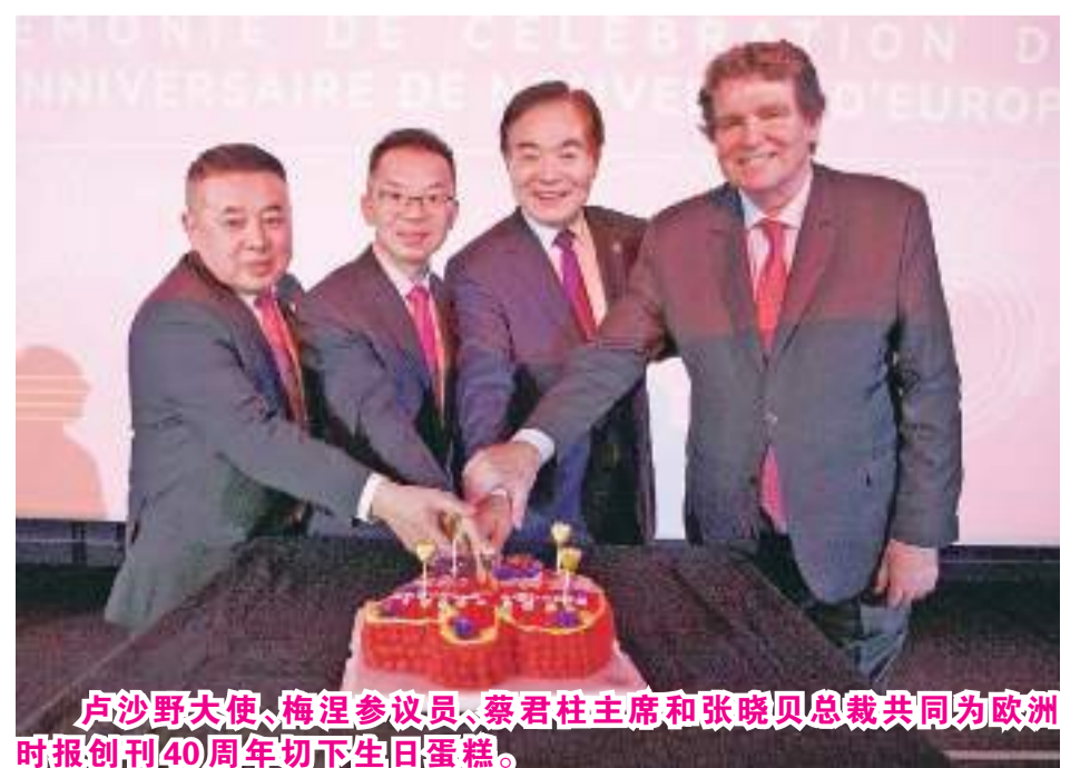
卢沙野大使、梅涅参议员、蔡君柱主席和张晓贝总裁共同为欧洲时报创刊40周年切下生日蛋糕。

据介绍,《欧洲时报》致力于法中交流与友好事业,促进华人融入法国社会,春节期间定期推出法文特刊,向法国人介绍中国文化,向中国人介绍法国、欧洲文化。《欧洲时报》还与法国知名周刊《巴黎竞赛画报》合作出版多期中国特刊,介绍改革开放后中国的变化。