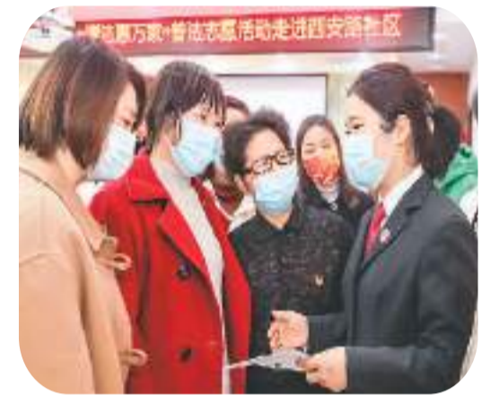
图为2022年3月7日，江苏淮安的法官向居民宣传妇女权益保护法律知识。