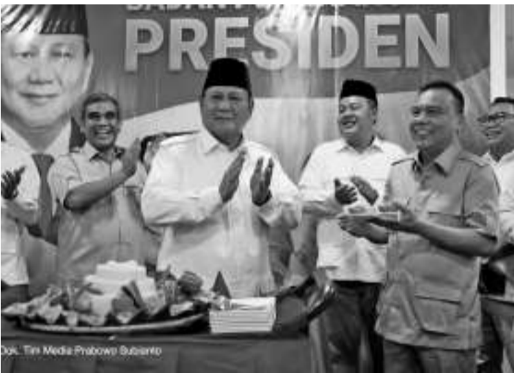
大印尼行动党总主席普拉波沃(中)。

【本报讯】周六(7/1/23), 在雅加达大印尼行动党总统获胜机构办公室揭幕典礼时, 大印党总主席普拉波沃强调说, 大印党必须与其他政党合作建设印度尼西亚。我们的国家幅员广大, 拥有及需要广阔的空间, 因此我们必须能够与其他政治力量、其他政党合作。 普拉波沃指出, 大印党尊重我国的所有政党。本党愿意与任何政党合作, 只要是为了我国民族、国家和人民的利益。虽然打开与其他政党合作的大门, 但本党仍然必须坚持党迄今为止坚持的主要价