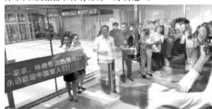
泰媒称，泰国副总理兼卫生部长阿努廷等人9日迎接中国旅客。

【环球网报道】据泰国《国民报》9日最新报道，载有中国游客的厦门航空MF833航班刚刚落地泰国。泰国副总理兼卫生部长阿努廷、泰国交通部长奇乔布，以及旅游和体育部长皮帕于在曼谷素万那普国际机场迎接中国游客。报道说，这批中国游客是1月8日后首批前往泰国的中国游客，泰国官方给予中国游客“英雄般的欢迎”。