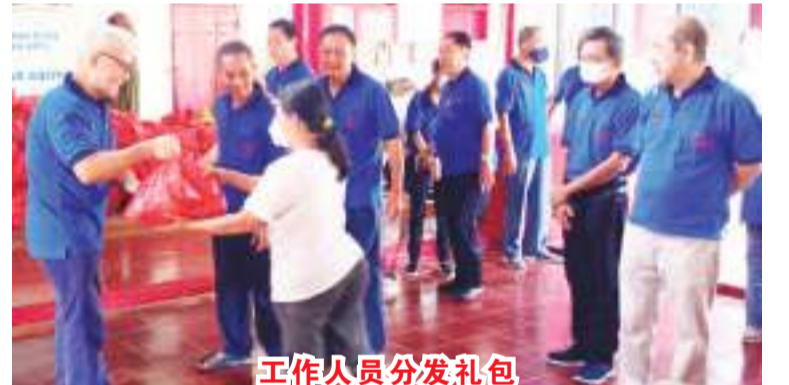
工作人员分发礼包