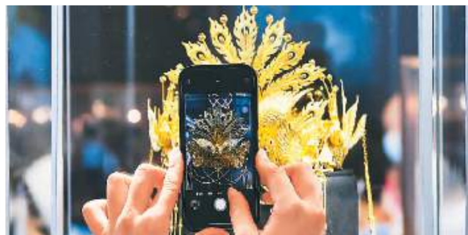
在海南省海口市举办的第二届中国国际消费品博览会上,一件国产黄金头饰吸引观众拍照分享。

业内人士提醒,打造“国潮”品牌的持久竞争力,还要警惕透支“国潮”红利,回归品牌本质。应在产品研发、供应链打造、数字化建设、组织能力培育等长期工程上持续投入,逐步实现以数字化为基础的商业模式升级。唯有靠质量与设计展示出核心竞争力,才能让“国潮”站稳脚跟,带给消费者更多惊喜。