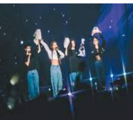
MAMAMOO繼2019年之後再次到港開秀。

香港文匯報訊(記者文芬)韓國女團MAMAMOO世界巡迴演唱會香港首站於1月7日及8日在亞博館舉行,這是2019年之後,MAMAMOO再次到香港舉行演唱會,她們除了獻唱《Yes I am》、《HIP》、《AYA》等多首經典歌曲,更預備了多個驚喜舞台,讓歌迷大飽耳福。演唱會一開始,MAMAMOO就為MOO MOO(MAMAMOO粉絲稱號)們送上第一次在香港獻唱的新專輯歌曲《1,2,3 Eoi!》,而為了拉近跟觀眾們的距離,她們更急不及待由主舞台走到延伸舞台跟久違的香港觀眾打招呼!另一亮點則是在她們官方頻道曾經透露過