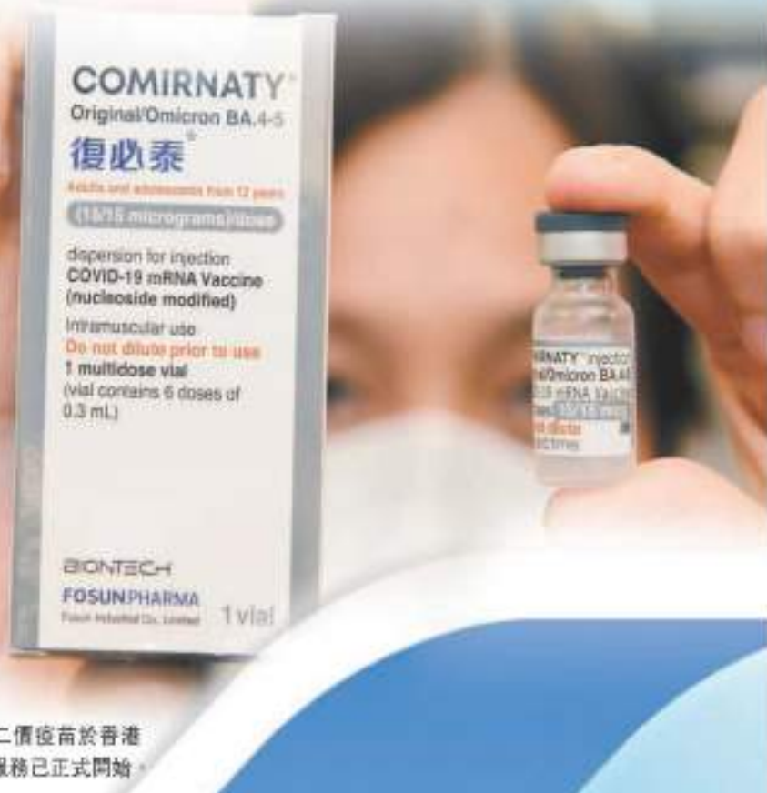
復必泰二價疫苗於香港自費接種服務已正式開始。

根據正在進行的2/3期全球臨床試驗顯示，以復必泰二價疫苗作加強劑接種1個月後，可產生強烈的中和抗體反應。與接種加強劑前相比，55歲以上人士的中和抗體可提高13.2倍，而18-55歲人士的中和抗體則提高9.5倍。這表明復必泰二價疫苗加強劑或較原始株疫苗對Omicron BA.4/BA.5變種病毒產生更高的保護。在香港特區政府的接種計劃下，截至1月7日，復必泰二價疫苗在本港已接種超30萬人次。