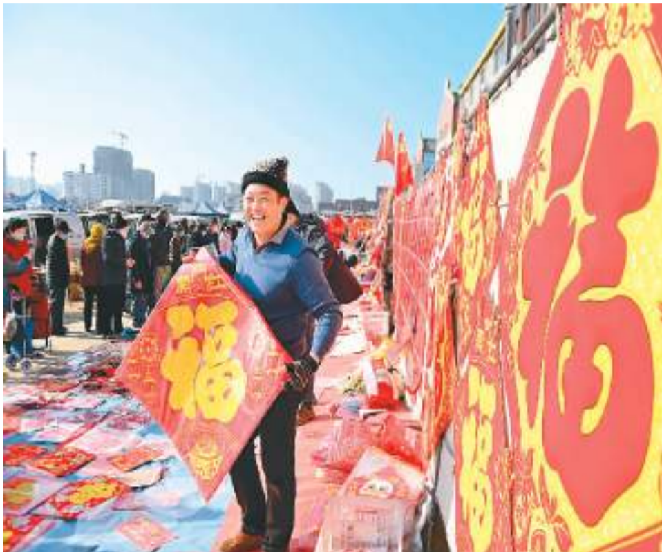
2023年1月2日，山东省青岛市西海岸新区灵山卫大集，一位商贩在帮顾客挑选“福”字。