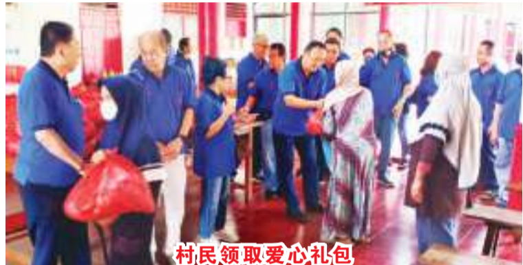
村民领取爱心礼包