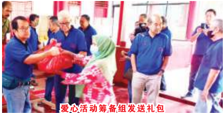
爱心活动筹备组发送礼包