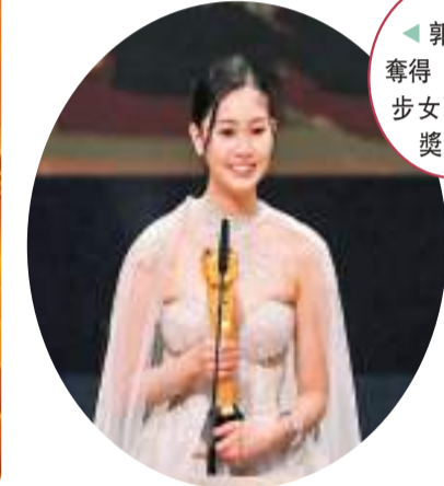
郭柏妍奪得「飛躍進步女藝員」獎。