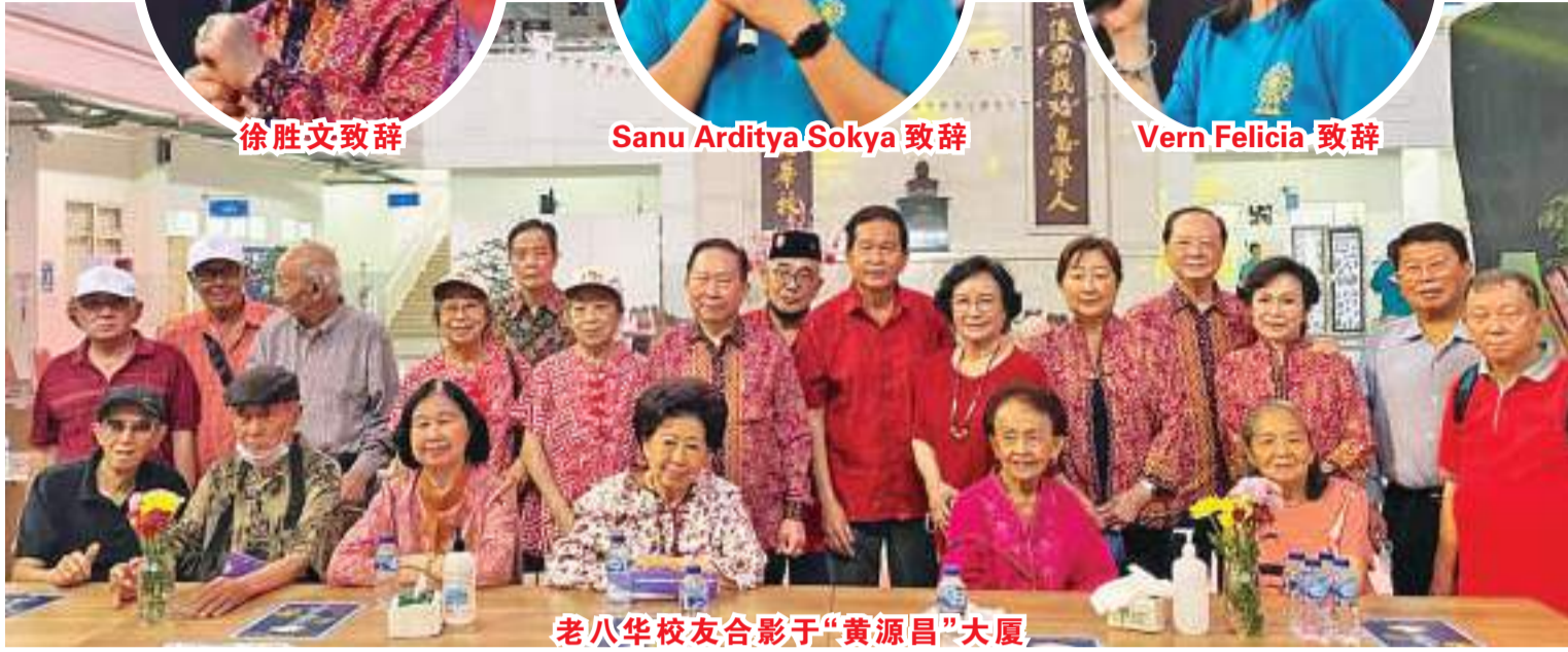
老八华校友合影于“黄源昌”大厦