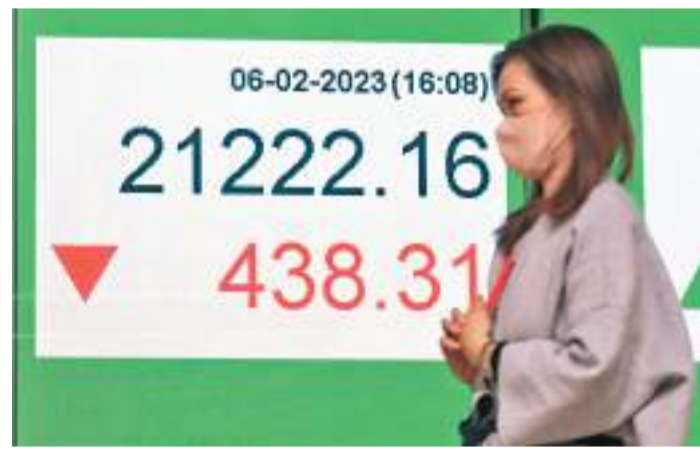
◆港股連跌三日，6日一度瀉574點，成交1,361億港元。 中新社

內地上月樓市成交跌勢未止，內房及物管股繼續捱沽，碧眼跌6.1%。萬科上月合同銷售額按年跌近兩成，股價跌4.1%。此外，由於美匯回升，金價回落，山東黃金跌6%，紫金跌5.1%。