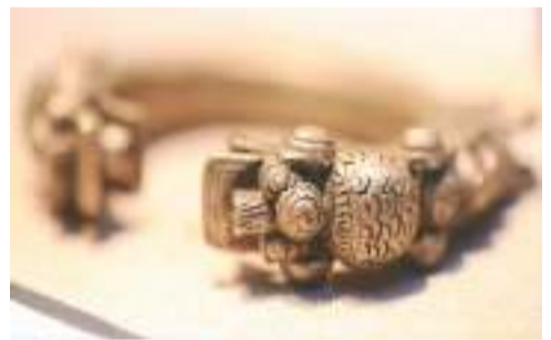
迪庆藏族龙头手镯。

自1995年建成开馆以来，云南民族博物馆以保护、弘扬民族文化为己任。馆内珍藏民族文物近5万件（套），基本陈列有“民族服饰与制作工艺”“民族文字古籍”“民族乐器”“民族民间陶艺”“民族民间面具”“民间瓦当”“民族工艺美术”“铸牢中华民族共同体意识 建设全国民族团结进步示范区——中国特色解决民族问题正确道路的云南实践”。