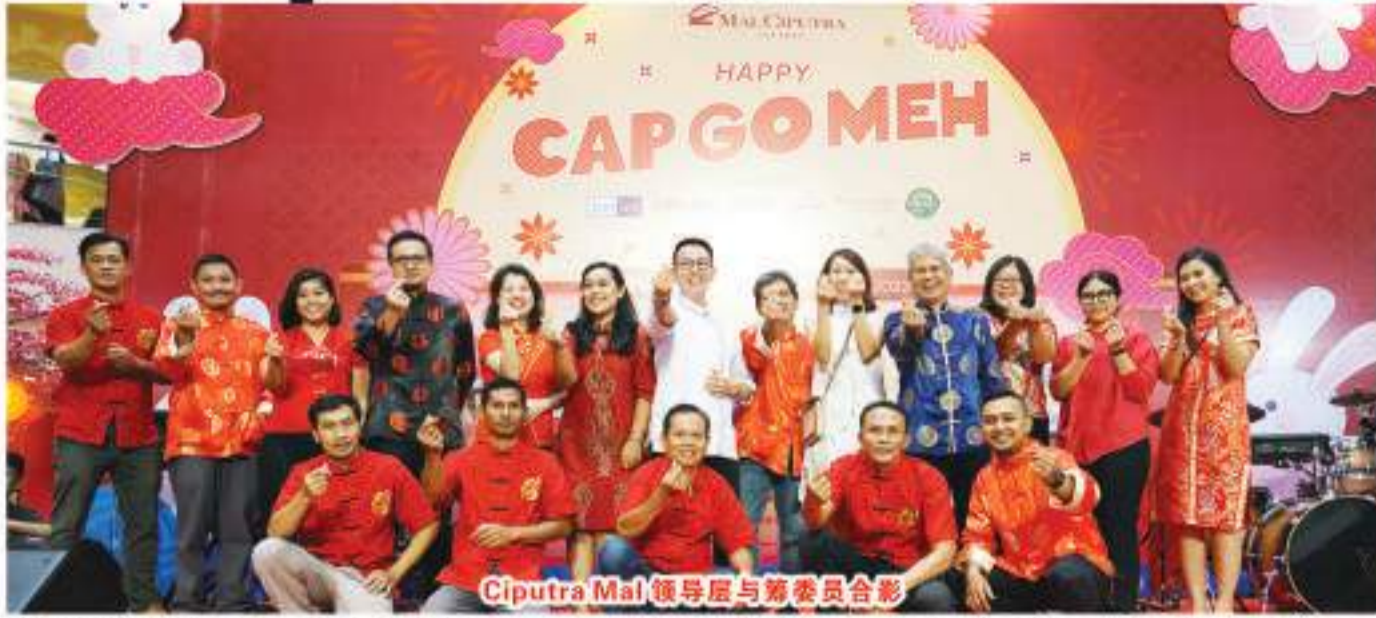
Ciputra Mal 领导层与筹委员会合影