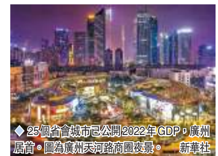
◆25個省會城市已公開2022年GDP，廣州居前。圖為廣州天河路商圈夜景。

據各地統計部門數據顯示，2022年，武漢市GDP為18,866.43億元，杭州市GDP為18,753億元。兩個城市的GDP數值均接近於1.9萬億元，是「2萬億俱樂部」的預備役。排名中變化最大的是福州，2022年福州GDP為12,308.23億元，同比增長4.4%，一舉超過濟南和合肥，在省會城市中排名第8。2022年，石家莊市實現生產總值7,100.6億元，按不變價格計算，比上年增長6.4%，遠高出全國平均水平的3%，是唯一實際增速超過5%的城市。