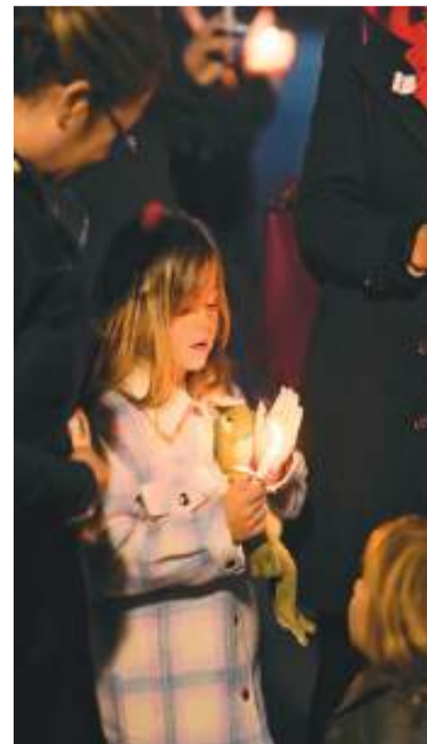
1月31日，在美国加利福尼亚州半月湾市，一名女孩手持持枪炸毁枪击事件遇难者。

长期以来，以全国步枪协会为代表的反控枪组织以及它们背后的枪械制造商向美国政客“慷慨”输送政治献金，以阻挠控枪立法。沃茨说：“全国步枪协会花钱让政客们不作为。”