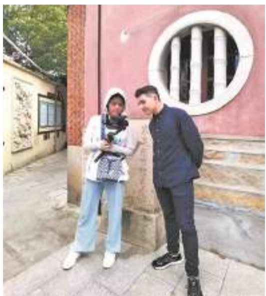
“老外”小龍(右)和朋友參觀泉州市舶司

看春晚、發紅包、貼春聯、買新衣、吃年夜飯，融入中國年俗的外國友人們，感受着世遺泉州的獨特韵味