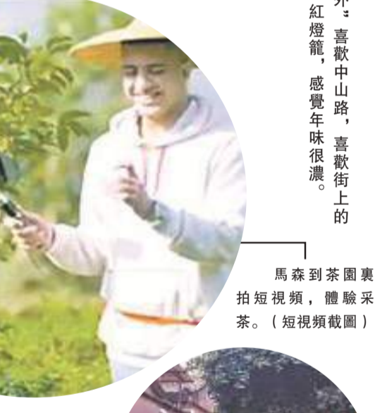
馬森到茶園裏拍短視頻，體驗採茶。(短視頻截圖)