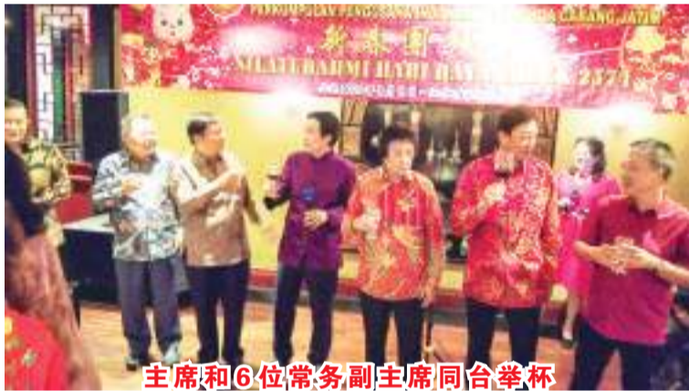
主席和6位常务副主席同台举杯

晚宴在祝福声中拉开了序幕,席间欢歌艳舞,自由节目精彩纷呈,一派祥和温馨的场面把大家都带入到浓厚的节日气氛里,历时二个多小时,增进了该会同仁的情谊!最后全体理事监事合影留念,记录并见证了跨年之喜悦,和谐而温馨地结束了这一顿丰盛的团圆晚宴,让我们留下了美好的回忆。