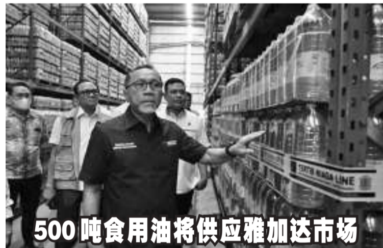
500吨食用油将供应雅加达市场

城市周围的森林包括热带雨林、次生林、红树林、保护林和城市周围的其他生态系统。 (lrw)