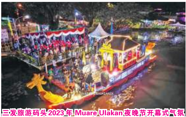
三发旅游码头2023年 Muare Ulakan 夜晚节开幕式气氛

他希望今晚的节日(彩船赛)能够井井有序和顺利地举行，因此明年就能够以更加精彩的形式再举办。(lus)