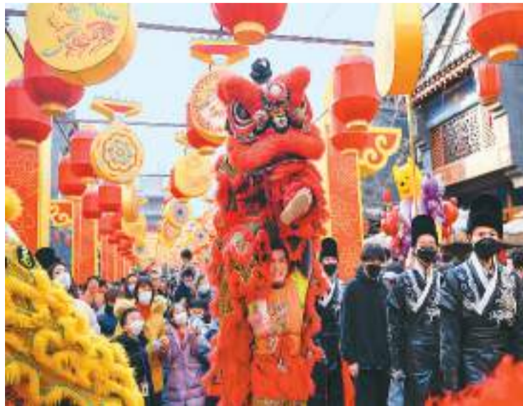
近日，甘肃省兰州市七里河区老街，游人如织。人们赏舞狮、看表演、猜灯谜、品美食，处处洋溢着热腾腾的“烟火气”。兰州老街通过多场景布局、多业态融合、沉浸式消费等途径，每天吸纳近10万游客，成为城市商业、文化和旅游地标。图为游客在七里河区老街观赏舞狮表演。

一方面，稳定新车消费。今年将继续推动汽车消费由购买管理向使用管理转变。同时，将开展形式多样的汽车促消费活动，稳住新车消费增量。