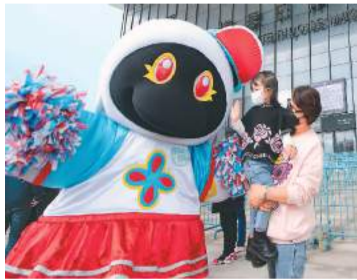
2月6日，广东省赴澳门首发团成员和澳门吉祥物“麦麦”合影。

本报澳门2月6日电（记者富子梅）6日，来自内地6个省市旅行团共135人，分别经陆路及空路抵达澳门。这是疫情以来澳门迎来的首批内地旅行团。