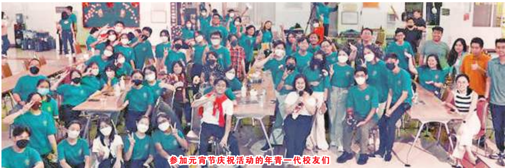
参加元宵节庆祝活动的年青一代校友们