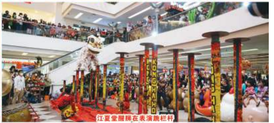
江夏堂舞狮在表演跳栏杆