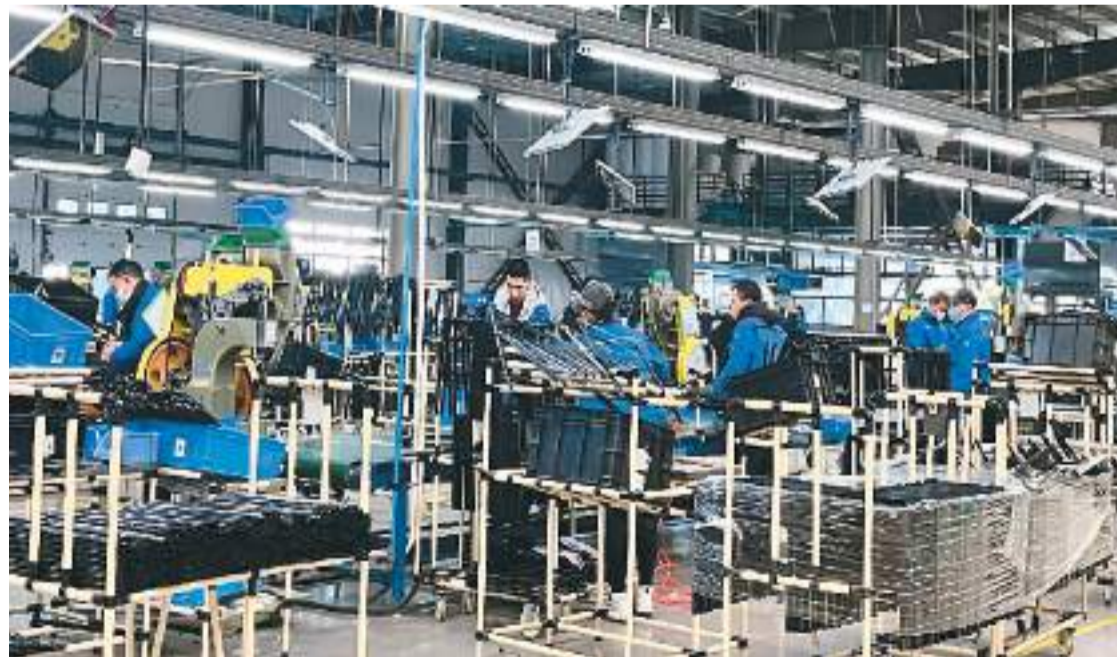
图为工人在浙江侨企泰普森实业集团生产车间中忙碌。

侨商侨企踊跃向前,各展身手;侨务部门保驾护航,温暖侨心。浙江省委统战部开展“助侨直通车·侨企大走访”活动,到侨企“走家串户”,倾听心声,回应诉求;广东中山侨联举办“侨界与政府面对面”座谈会,请来商务局干部与