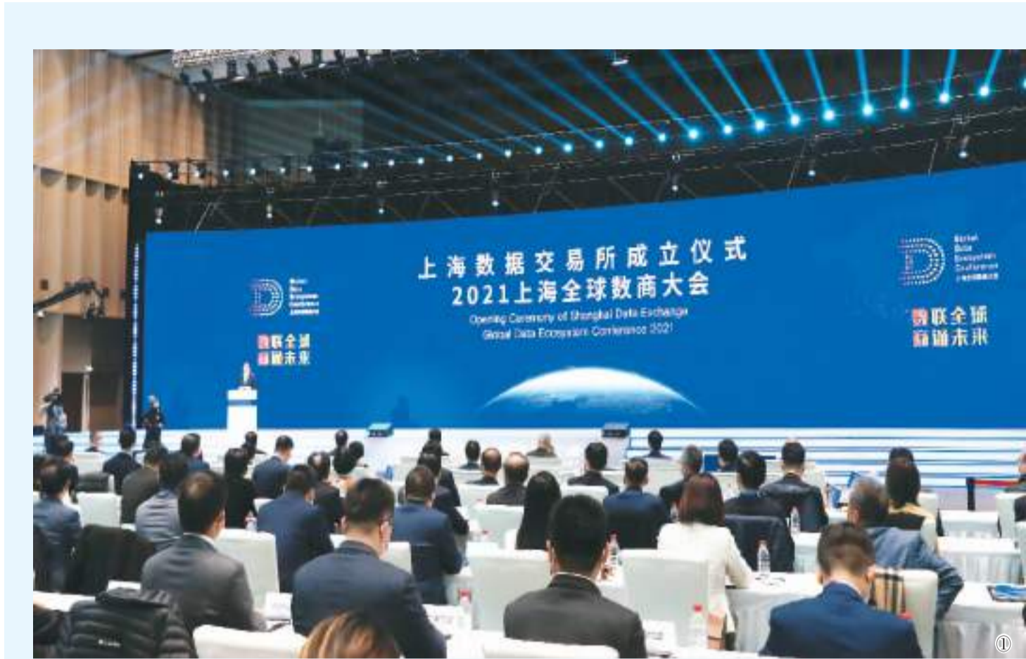
图1：2021年11月25日，上海数据交易所成立仪式暨2021上海全球数商大会在沪举行。

为进一步激活数据要素潜能、丰富数据应用场景，“数据二十条”提出，“结合数据要素特性强化高质量数据要素供给”“鼓励企业积极参与数据要素市场建设”。中国信息通信研究院院长余晓晖认为，“‘数据二十条’针对公共数据，明确授权运