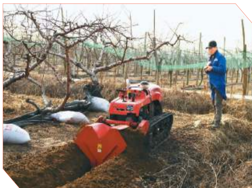
▲ 2月1日,在江苏省淮安市洪泽区东双沟镇一桃园内,农民操作多功能无人旋耕机松墒理沟。

▶ 连日来,山西省丰喜肥业临猗分公司全天候开足马力生产,保障春耕用肥。图为1月31日,尿素车间工人操作机械搬运化肥。