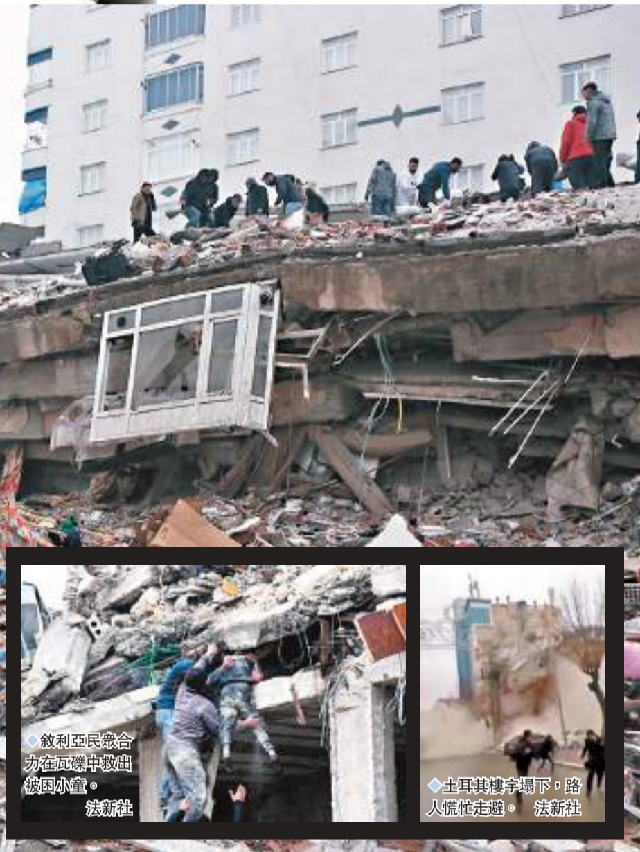
敘利亞民衆合力在瓦礫中救出被困小童。