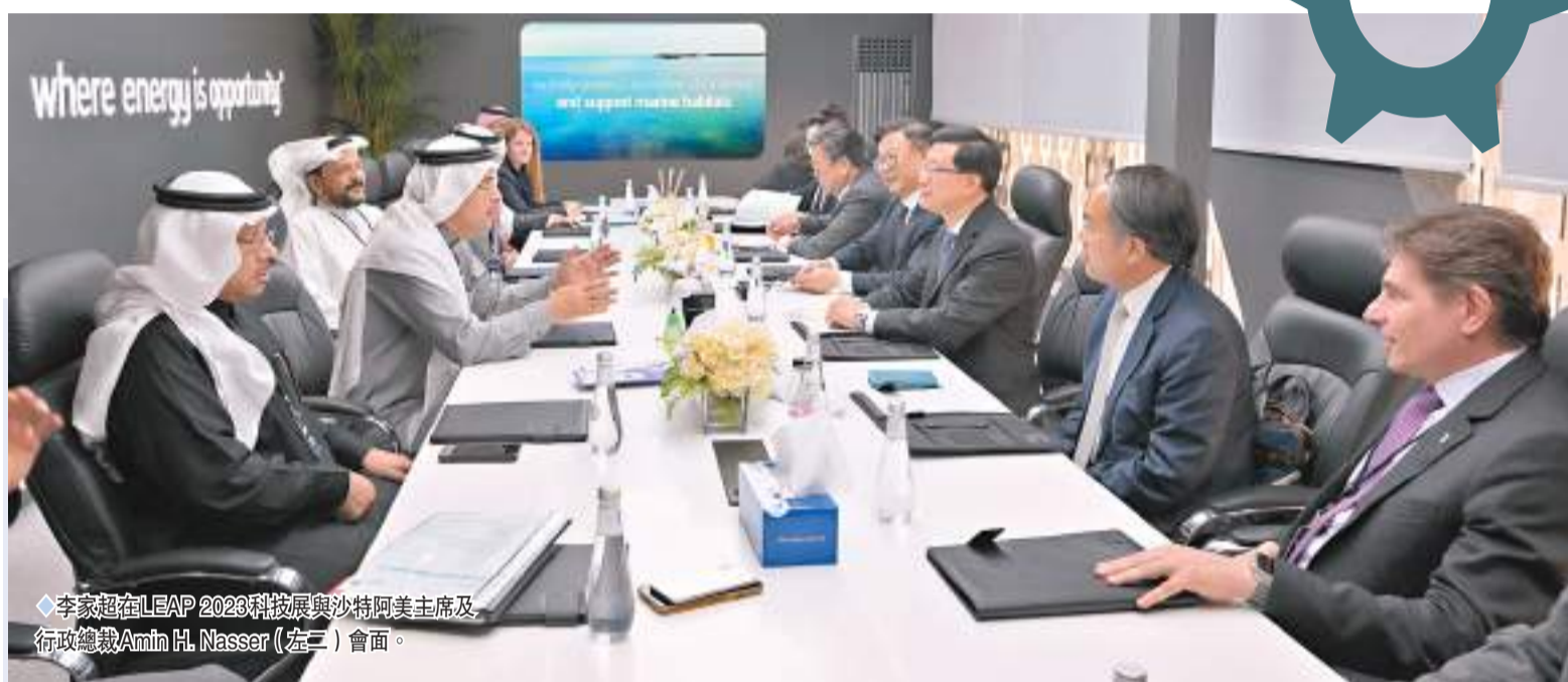
李家超在LEAP 2023科技展與沙特阿美主席及行政總裁Amin H. Nasser（左三）會面。