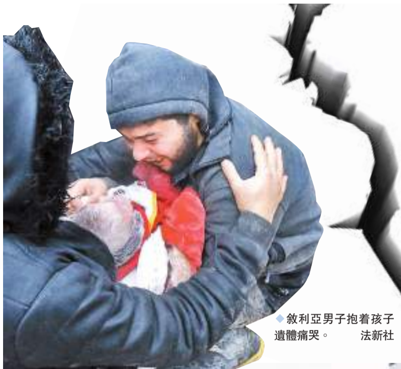
敘利亞男子抱着孩子遺體痛哭。

土耳其東南部當地時間6日發生大地震，震級達黎克特制7.8級，已造成土耳其和鄰國敘利亞共逾4,000人死亡，逾萬人受傷。今次是近百年來這個區域最強的地震之一，更是土耳其自1939年以來規模最大的地震災情。由於大量建築物倒塌多人被困，預計死亡人數仍會上升，土耳其政府已請求國際援助救災。