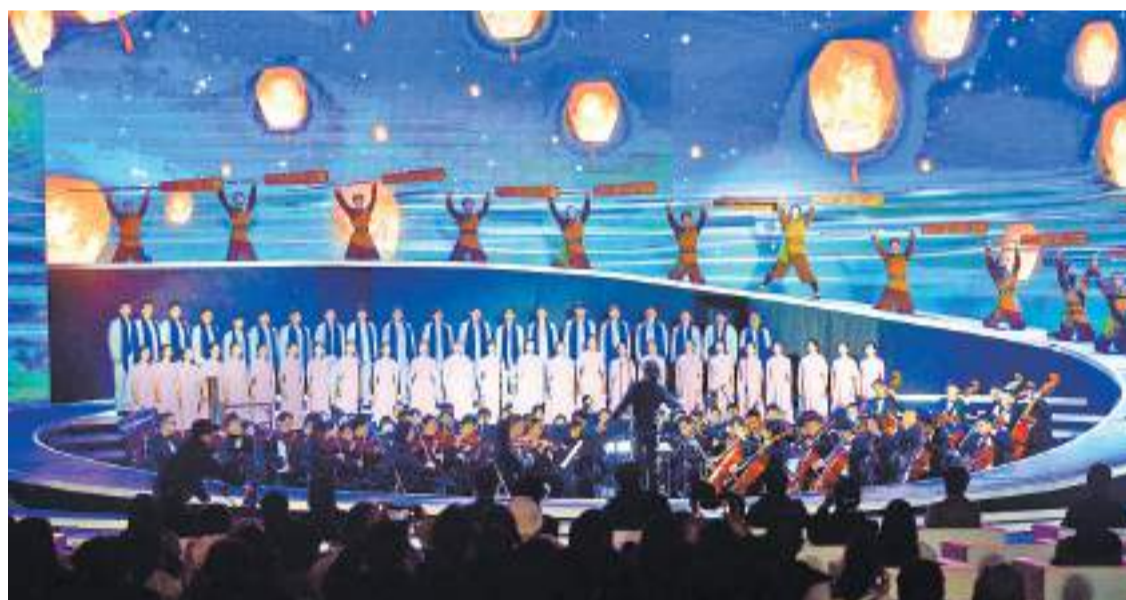
交响音画《海峡 海峡》在闽江之心青年广场奏响。