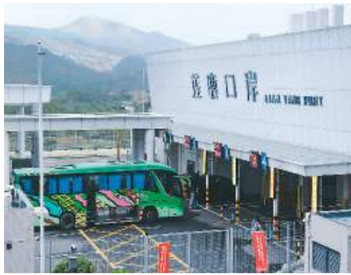
2月6日，车辆在深圳莲塘口岸出境。