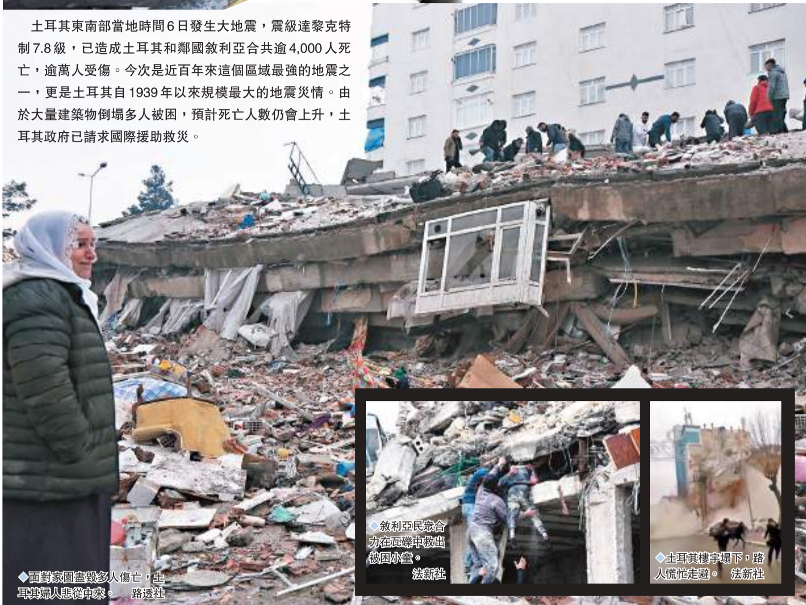
面對家園盡毀多人傷亡，土耳其婦人悲從中來。

土耳其東南部當地時間6日發生大地震，震級達黎克特制7.8級，已造成土耳其和鄰國敘利亞共逾4,000人死亡，逾萬人受傷。今次是近百年來這個區域最強的地震之一，更是土耳其自1939年以來規模最大的地震災情。由於大量建築物倒塌多人被困，預計死亡人數仍會上升，土耳其政府已請求國際援助救災。