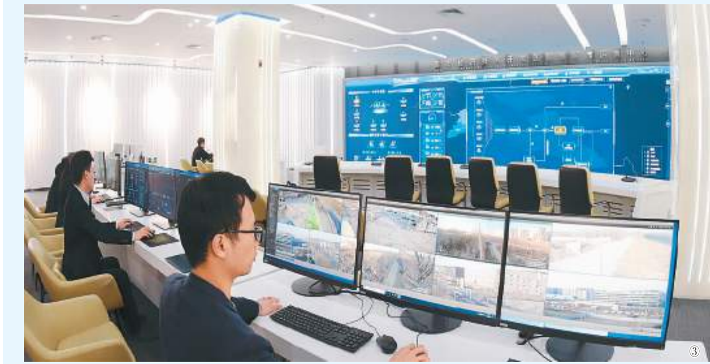
图3：图为工作人员在河北省廊坊市开发区智慧城市大数据平台实时监测人流密度、车流密度、人流迁徙等情况。

营，按用途加大公共数据供给使用；针对企业数据，强化供给激励，发挥国有企业带头作用。这些制度设计将极大提升数据供给。”