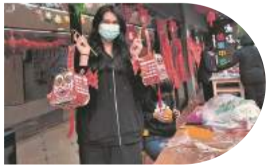
來自土庫曼斯坦的Bil愛上了喜慶的燈籠

主動參與豐富多彩的民俗活動，感受濃濃的春節氛圍；和朋友們結伴到古城的世遺點游玩，體驗世遺泉州的魅力；把所見所聞通過短視頻發布，將泉州推介給家人和世界各地的朋友……今年不少“老外”在泉州過了一個不一樣的春節。