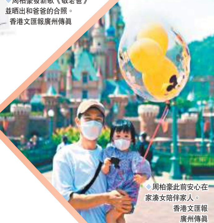
◆周柏豪此前安心在家湊女陪伴家人。