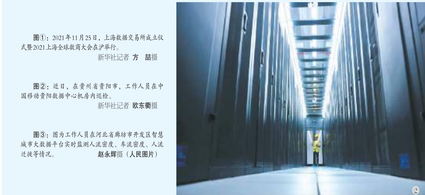
图2：近日，在贵州省贵阳市，工作人员在中国移动贵阳数据中心机房内巡检。