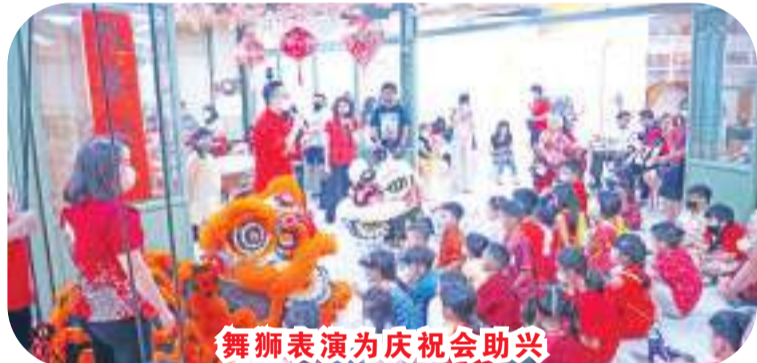
舞狮表演为庆祝会助兴

【本报讯】Kebon Jeruk 儿童汉语学习中心 Children Learning Chinese (CLC) 与学生们及其家长们于周六(04/02/2023)共庆元宵节,同时也庆祝位于雅加达西区 Taman Kebon Jeruk A4 座 Kebon Jeruk Permai