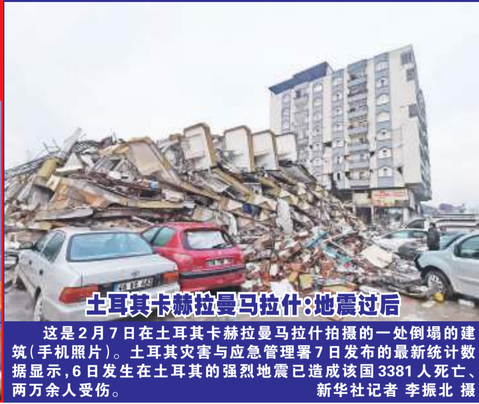
土耳其卡赫拉曼马拉什:地震过后

这是2月7日在土耳其卡赫拉曼马拉什拍摄的一处倒塌的建筑(手机照片)。土耳其灾害与应急管理署7日发布的最新统计数据,6日发生在土耳其的强烈地震已造成该国3381人死亡、两万余人受伤。