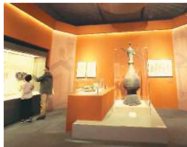
“智慧之光——中医药文化展”现场。