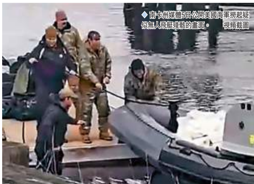
◆南卡州媒體5日公開美國海軍撈起疑似無人飛艇殘骸的畫面。視頻截圖

毛寧強調，此次飛艇誤入美國領空完全是意外偶發事件，但考驗的是美方對穩定和改善中美關係的誠意以及處理危機的方式。美方應當同中方相向而行，妥善管控分歧，避免誤解誤判，破壞彼此互信。