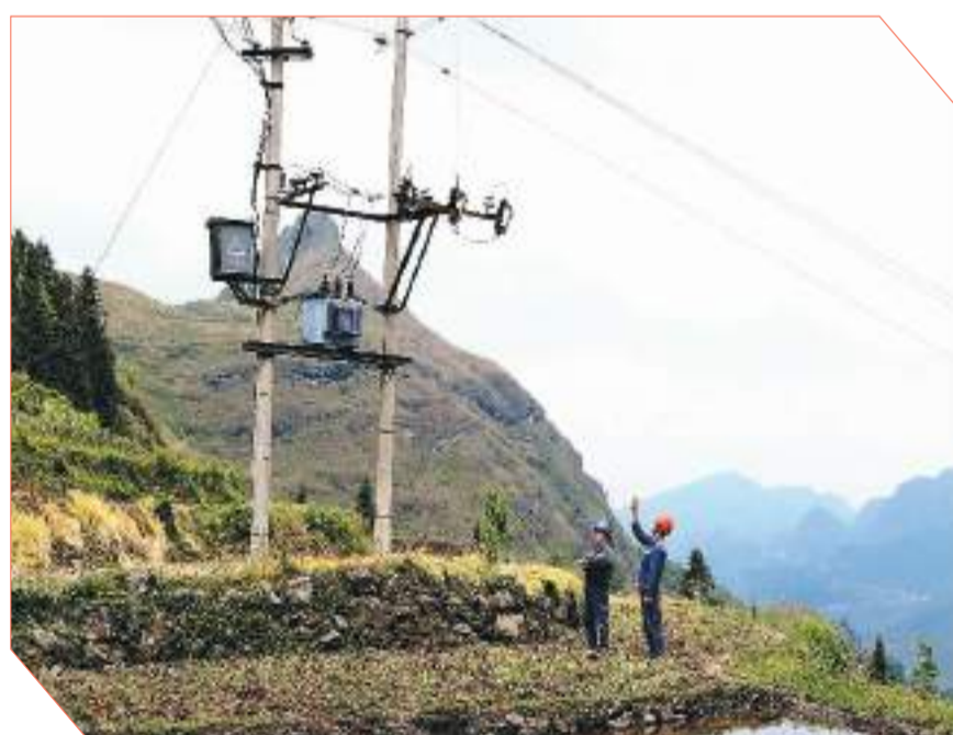
▲ 2月1日,为保障春耕用电,在贵州省黔东南苗族侗族自治州,南方电网贵州兴义晴隆供电局工作人员走进田间巡检,确保配电设备安全稳定运行。