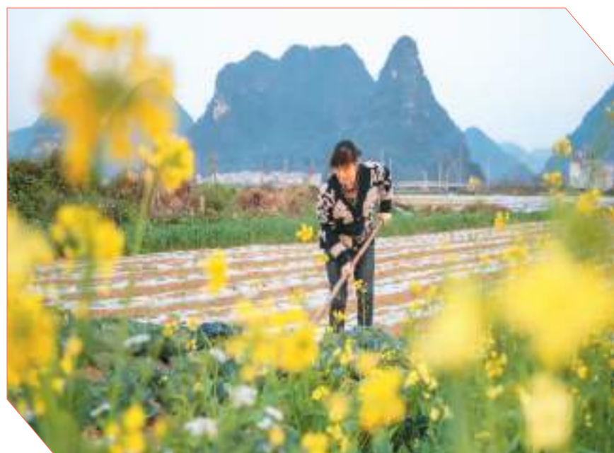
▲ 1月29日,在广西壮族自治区靖西市新靖镇亮表村,农民在田间劳作。