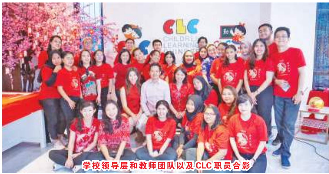
学校领导层和教师团队以及CLC职员合影