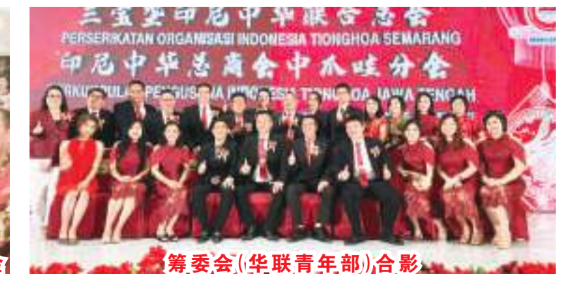
筹委会（华联青年部）合影