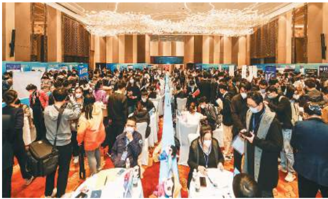
▲1月31日，“回归家乡·投身自贸港”春节返乡人才对接会在海南省海口市海南迎宾馆举行，教育、管理、财务、医疗医药等行业的不少外资企业参加招聘。

例如，围绕上述外资研发中心的共性诉求，《措施》提出允许以团队为单位申请工作许可和工作类居留许可，给予告知承诺、容缺受理等便利；推动海外人才跨境资金收付便利化；鼓励金融机构为外资研发中心科技创新、从事基础和前沿研究提供金融支持等。