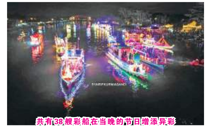
共有38艘彩船在当晚的节日增添异彩