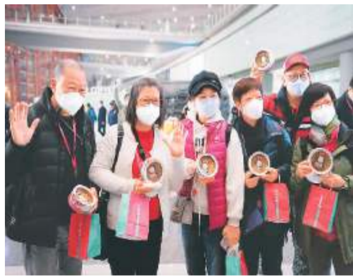
2月6日，内地与港澳人员往来全面恢复后，香港赴北京首个旅游团的游客在首都国际机场手举纪念礼品合影。

当日，首个香港赴北京旅游团共17名游客抵达首都国际机场，开启他们4晚5天的北京之旅。