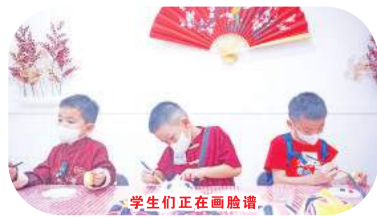
学生们正在画脸谱