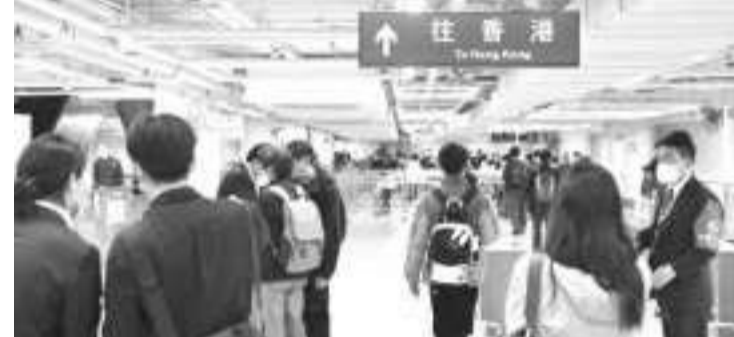
图为前往香港的旅客有序出境。

【中新网2月7日电】据香港“点新闻”报道，6日，香港与内地恢复全面通关。香港特区署理行政长官陈国基今日(7日)见记者时表示，通关首日