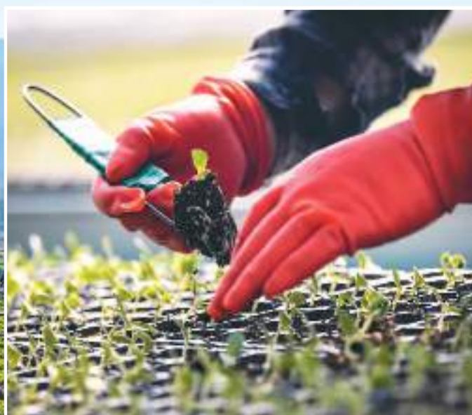
◀ 近日,宁夏回族自治区银川市贺兰县各主要种苗繁育基地的大棚内满眼绿色,工人们忙着为即将到来的春耕培育幼苗。图为2月1日,工人在贺兰县深溪堡佳禾种苗繁育基地一次棚内补苗。