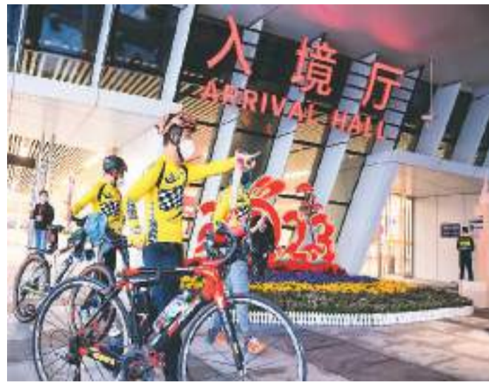
2月6日，在深圳莲塘口岸，龙坊俱乐部的香港骑行爱好者带着自行车入境。