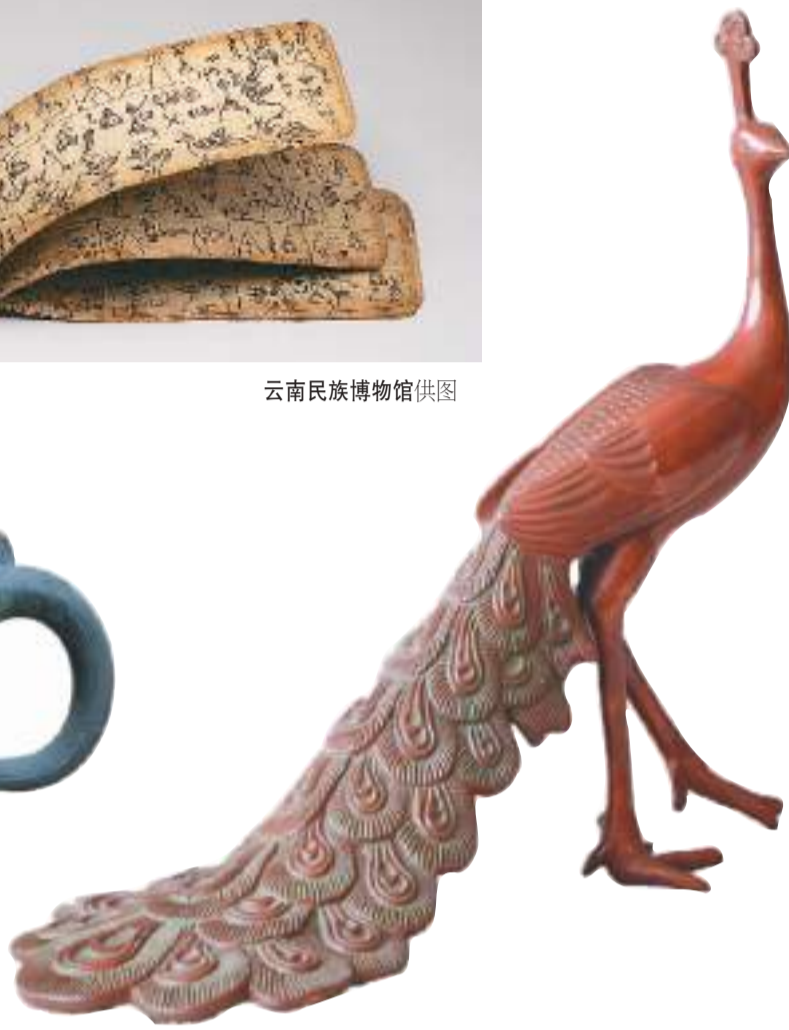
昆明汉族熟斑铜孔雀。