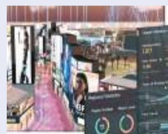
商湯科技為利雅得季打造AI+AR數字化、3D可視化的智慧管理平台。