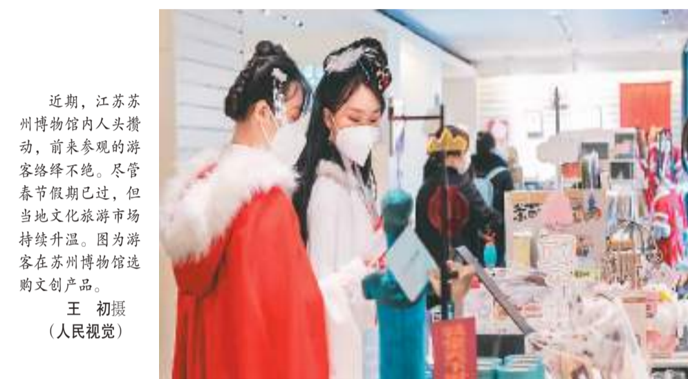
近期，江苏苏州博物馆内人头攒动，前来参观的游客络绎不绝。尽管春节假期已过，但当地文化旅游市场持续升温。图为游客在苏州博物馆选购文创产品。

另一方面，支持新能源汽车消费。引导各地在牌照、充电、通行等各个方面，进一步优化新能源汽车使用环境，让消费者使用起来没有顾虑。