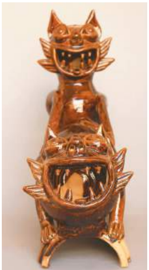
昆明汉族瓦猫夫妻猫。