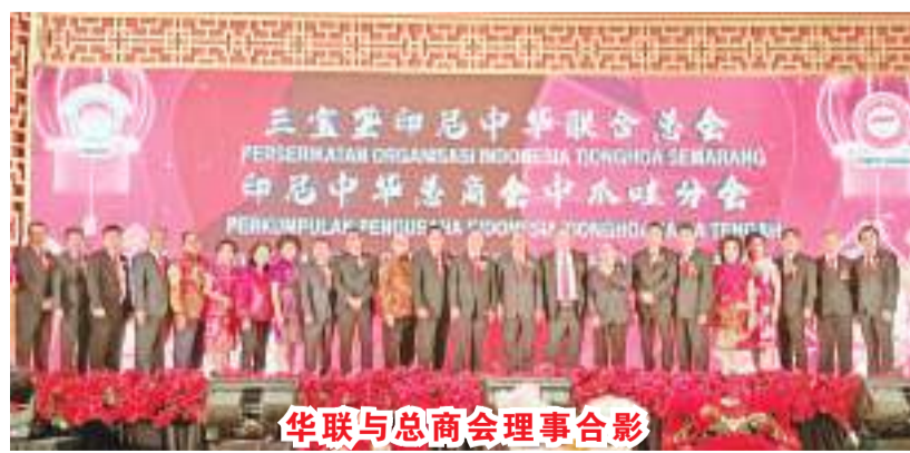
华联与总商会理事合影