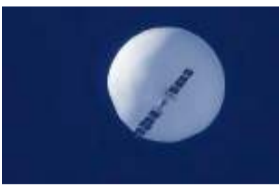
◆中方表示，誤入美領空的是民用無人飛艇，不具威脅性。