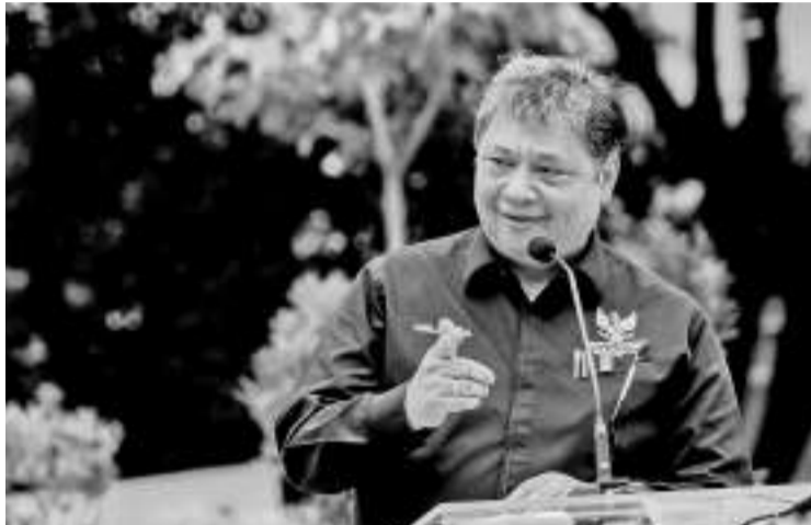
经济统筹部长艾朗卡(Airlangga Hartarto)为梭罗科技区(Solo Techno Park)主持开幕仪式。

我国的数字经济是加快复苏和增强国家经济韧性的关键之一。在2022年期间,印尼数字经济在东盟数字经济交易总额中,成功享用了40%左右的份额。为加快步伐,政府已为根基方面,包括提高人