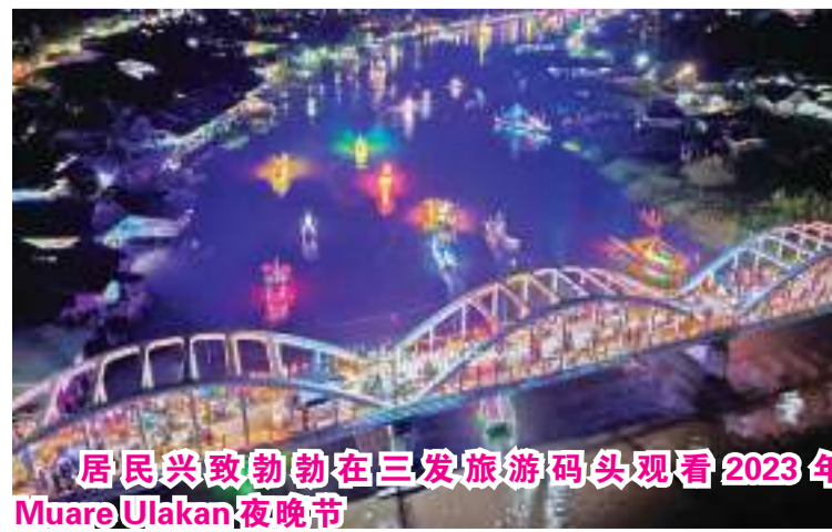
居民兴致勃勃在三发旅游码头观看2023年 Muare Ulakan 夜晚节