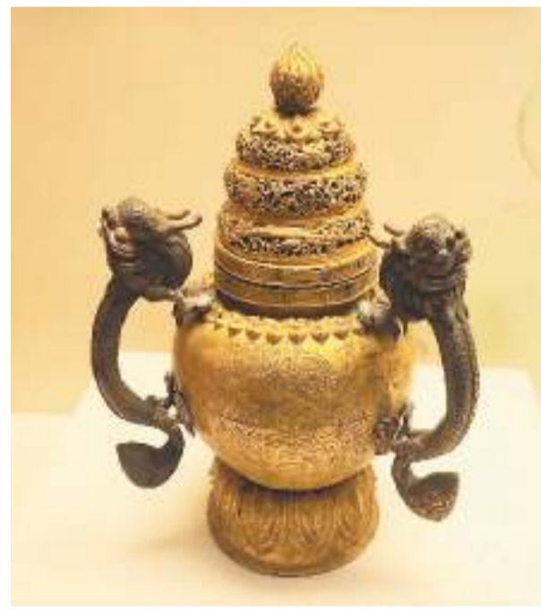
铜鎏金整刻文字纹镂空云纹盖三耳耳覆莲座熏炉，中国国家博物馆藏。

中国科学家屠呦呦获得诺贝尔生理学或医学奖的证书和奖章尤为引人注目。屠呦呦多年从事中药和西药结合研究，创制出新型抗疟药青蒿素，可以有效降低疟疾患者的死亡率，2015年获得诺贝尔生理学或医学奖。这是中医药不断创新、造福世界人民的光辉实例。