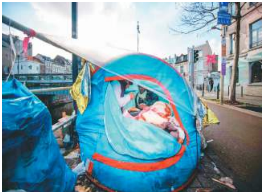
外，一月十七日，在比利时布鲁塞尔的移民接待中心，两名男子在临时帐篷里用餐。

专家指出，受财政压力、内部分歧、右翼民粹势力崛起等多重因素影响，欧盟各国对非法移民和难民的接纳意愿和能力有限。在地区冲突背景下，非法移民和难民潮还将持续困扰欧洲。