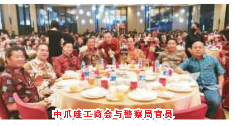
中爪哇工商会与警察局官员