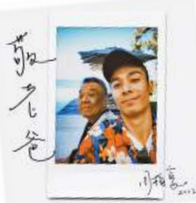
◆周柏豪發新歌《敬老爸》並晒出和爸爸的合照。香港文匯報廣州傳真