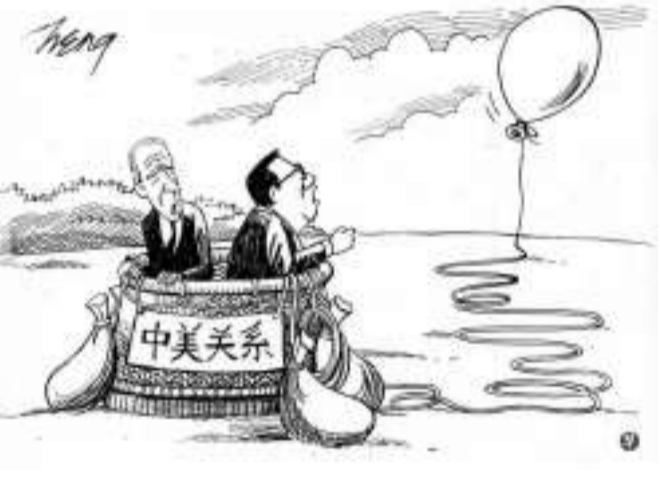
漫画 王锦松 (原载《联合早报》)

警方把监控画面中的袭击者头像进行比对后,对其身份为“比较清楚的判断”“他背后有一个完整的网络。”激进组织不能对美国联军、巴方军人下手,却对维持治安的警员、手无寸铁的平民袭击?不能在兵营战车放炸药,却在“上帝小屋”的清真寺内违戒杀人?他们竟自诩为“圣战士”,其实不过是愚昧、嗜血的“恐怖分子”!