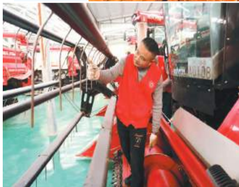
◀ 近日,四川省眉山市仁寿县农机服务小分队,深入乡村免费开展农业机械的检修、调试和保养等工作。图为1月31日,在仁寿县珠嘉镇,农机服务小分队正在帮助种粮大户检修农机。