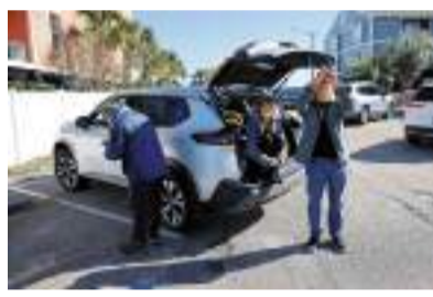
◆南卡州民眾4日仰望天空中的無人飛艇。