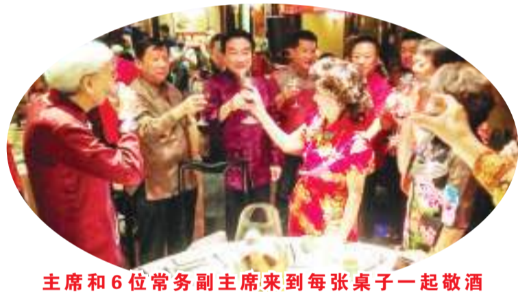
主席和6位常务副主席来到每张桌子一起敬酒