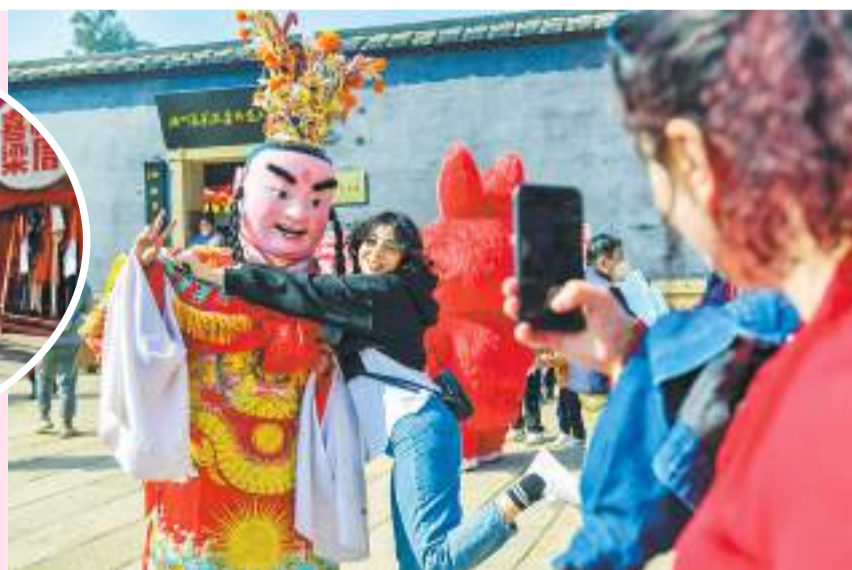
▶外国友人在活动现场拍照留念。