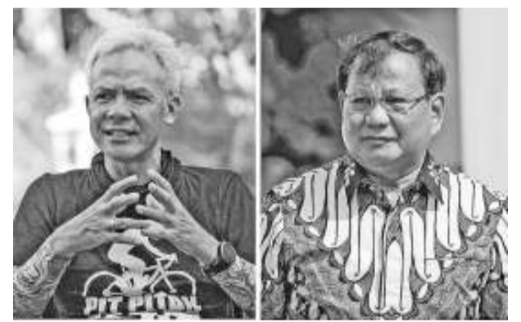
左起:甘贾尔和普拉波沃。