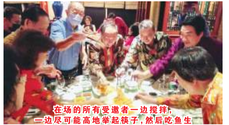
在场的所有受邀者一边搅拌,一边尽可能高地举起筷子,然后吃鱼生