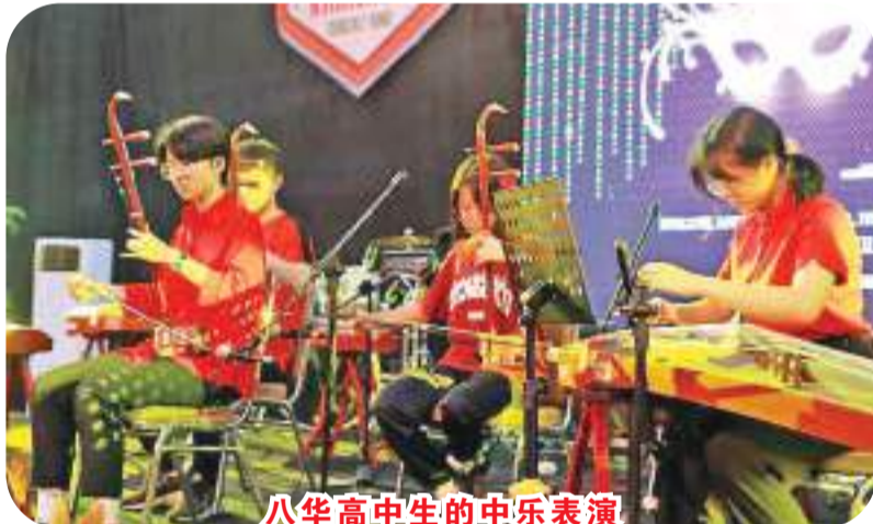
八华高中生的中乐表演