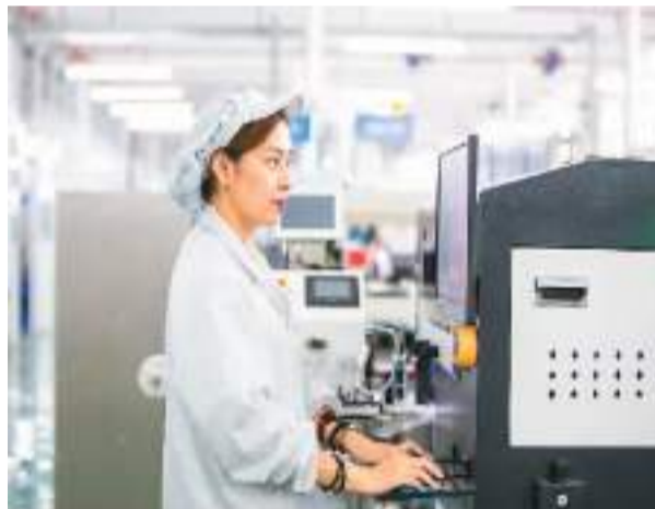
▶各地对外资企业精准施策，保产业链、供应链运转通畅。图为位于江苏淮安经济技术开发区的西蒙电气海安生产基地内，工作人员正在生产线上忙碌。

在许多外企重视的科技创新方面，新政府明确要加强对研发中心申请认定高新技术企业等的指导，为外资研发中心设立和运营提供更加高效精准的服务；支持依法使用大型科学仪器、科技报告和相关数据等，为外资研发中心开展基础研究和关键共性技术的研发提供有力的条件支撑。据了解，相关部门还将推动国家高新区、国家自主创新示范区在土地、产业、人才、宜业宜居环境等方面做好政策支持和服务保障。