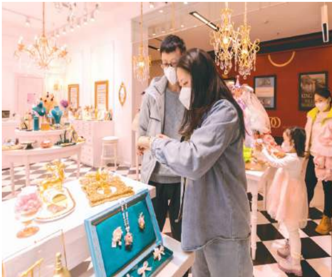
▲商起黄金首饰柜台吸引不少顾客驻足。图为顾客在内蒙古呼和浩特市玉泉区凯德茂购物中心选购首饰。

“以克计价的产品逐渐增加，国内零售商开始倾向于工艺附加值更高的产品。尽管普货产品在部分地区风头不减，但随着设计更精巧的产品推出，前者的市场份额进一步下降，因为年轻消费者审美在升级，对产品设计的更高要求，这在一线城市尤为明显，古法金饰品的迅速流行就是典型例子。”王立新介绍，古法金在终端市场的占比持续提升，更受消费者欢迎。