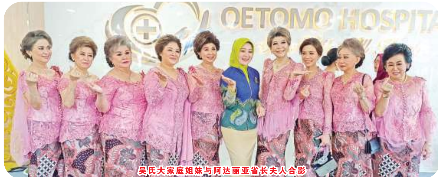
吴氏大家庭姐妹与阿达丽亚省长夫人合影

在孙达纳警长、卫生局、OETOMO医院的见证下，阿达丽亚博士在纪念碑上签字，礼成合影。剪彩后，嘉宾参观一些医院设施，揭幕礼圆满结束。(雪妮报道)