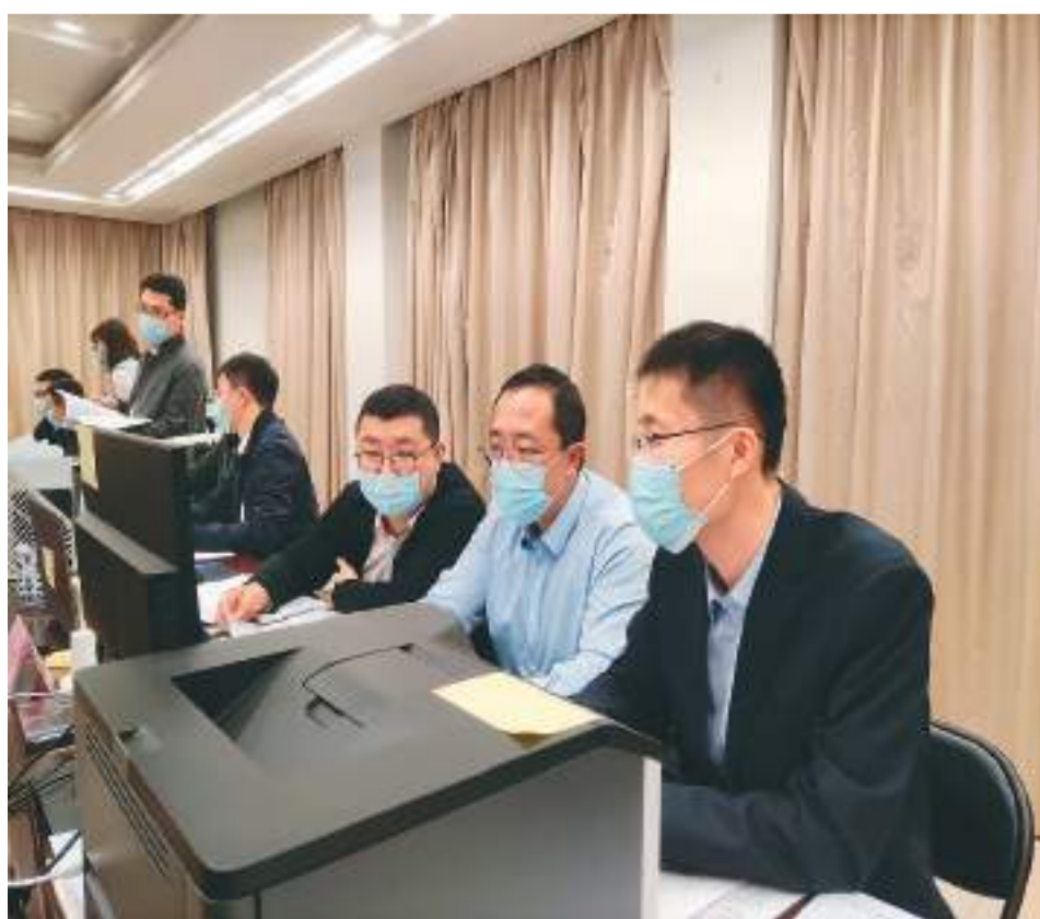
▲今年全国两会期间，国务院办公厅继续高质量旁听、汇总、转办代表委员意见建议，搭建政府和代表委员高效沟通的桥梁。图为3月5日，国务院办公厅工作专班工作人员在梳理汇总代表委员意见建议。