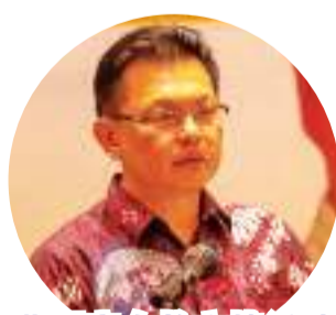
黄愿字会长主持活动