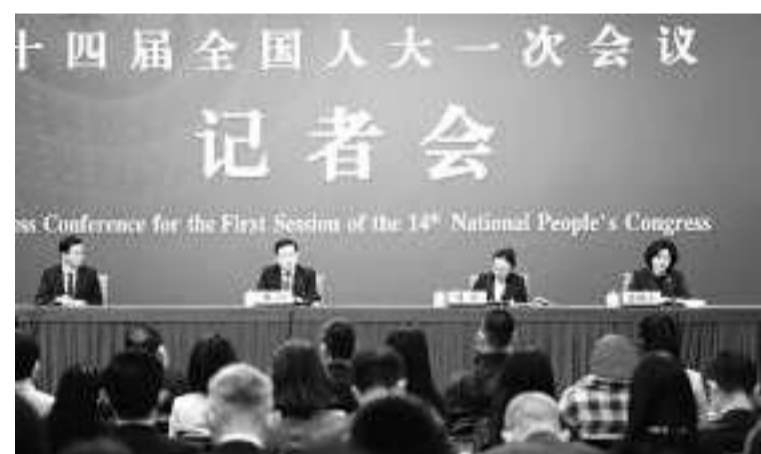
3月7日，十四届全国人大一次会议在北京梅地亚中心多功能厅举行记者会，外交部长秦刚就“中国外交政策和对外关系”相关问题回答中外记者提问。

不要低估中国政府和中国人民捍卫国家主权和领土完整的坚强决心、坚定意志和强大能力。