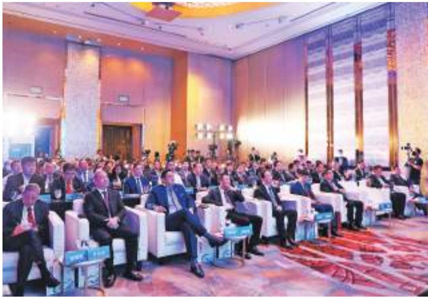
林宝金出席菲律宾-福州经贸对接会暨项目签约活动。

“一带一路”推动务实合作。访企业、看项目、谈合作……此次访问，行程紧凑，收获满满。在雅加达、吉隆坡、马尼拉，代表团先后举行3场经贸交流对接会，共签订24个重点合作项目，总金额491.8亿元。林宝金说，10年来，得益于习近平总书记的战略擘画和亲自推动，得益于“一带一路”倡议从理念转化为行动，福建福州与“一带一路”东南亚沿线国家优势互补、密切合作，实现了互利共赢、共同发展。我们将认真按照习近平总书记的重要讲话重要指示精神，坚决落实中国共产党中央和福建省委、福建省政府的部署要求，更好统筹国际国内两种资源、两个市场，坚定不移扩大开