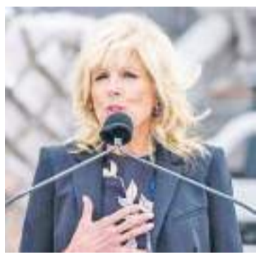
美国总统夫人吉尔·拜登

此前在1月30日，当记者询问美国是否将向乌克兰交付F-16战机的时，拜登曾给出了简短的回答——“NO(不)”。拜登上周还告诉记者，他在2月20日访问基辅期间曾与泽连斯基讨论过F-16战机问题，但不愿透露讨论的细节。