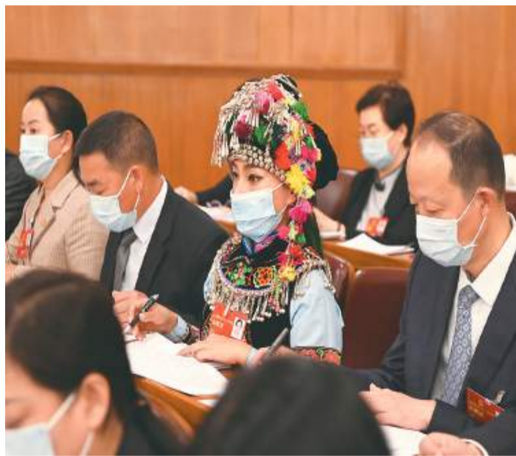
▲代表们在认真听会。