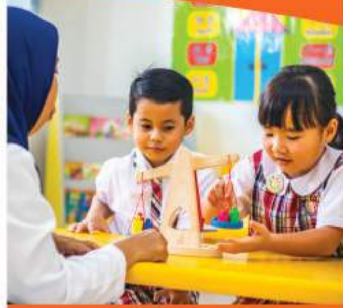
以CPA为基础的数学教学

学生的认知方面是通过采用以具体图像和抽象方法为基础的(CPA)数学课来进行发展的。鼓励学生不是死记硬背，而是在实践中进行探索，参与到完整的教学活动中来掌握。