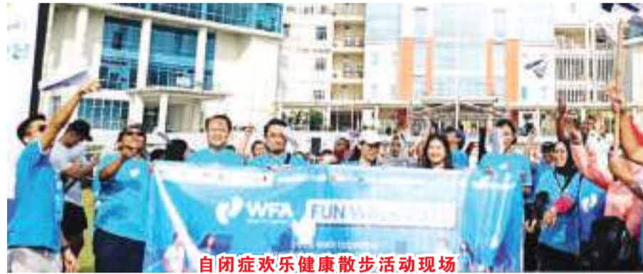
自闭症欢乐健康散步活动现场

爪哇国际青年商会重视开展各种慈善活动，包括关心自闭症孩子的健康，因此举行这次的户外健康散步活动，鼓励自闭症孩子锻炼身体，让他们在生活中拥有信心，勇于面对社会，追求心中的理想。