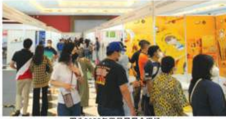
图为2022年印尼展展会现场

在2022年疫情还在肆虐之际, 由米奥兰特主导, 多方势力参与协作而举行的印尼贸易博览会取得了亮眼成绩: 短短三天就吸引到了超7200个买家, 现场实现精准商洽10630场, 覆盖率更是达到了100%!