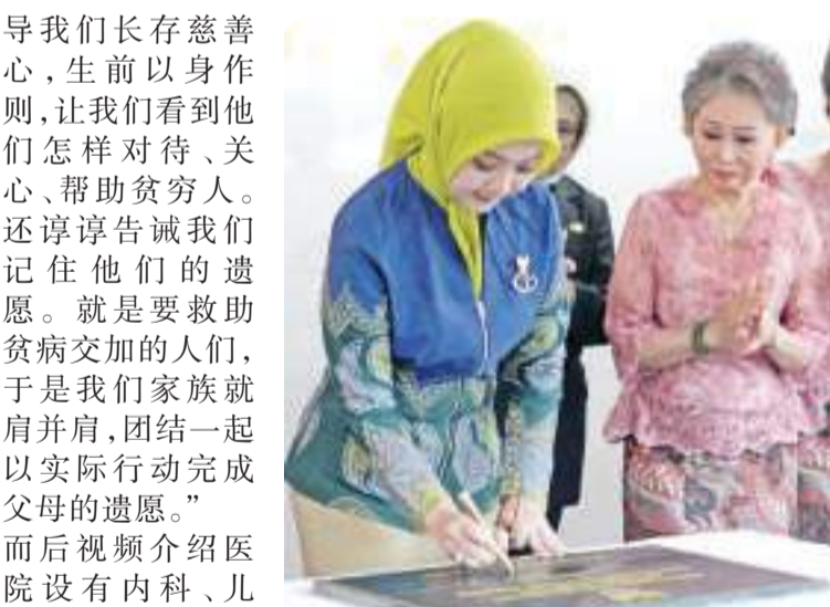
阿达丽亚在纪念碑上签字