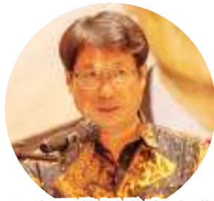
温海明教授发表演讲