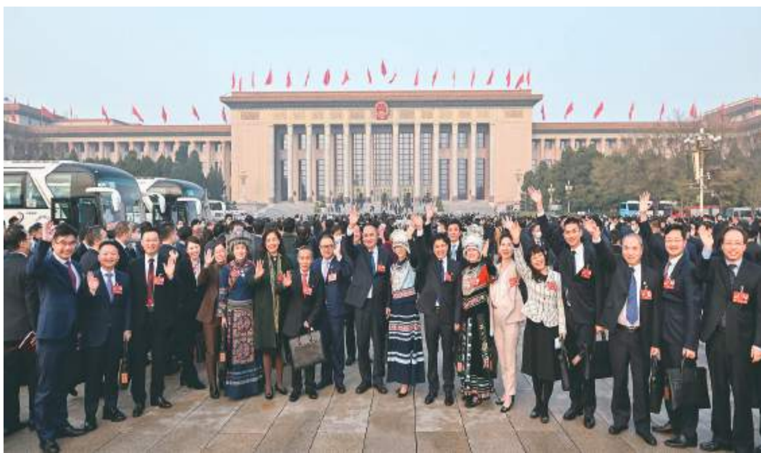
▲代表们在人民大会堂外。

实干赢得未来。围绕政府工作报告，出席两会的全国人大代表、全国政协委员认真审议，热烈讨论，为将党的二十大描绘的全面建设社会主义现代化国家的宏伟蓝图变为美好现实积极建言献策。