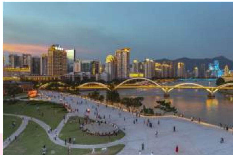
闽江之心打卡胜地青年广场。