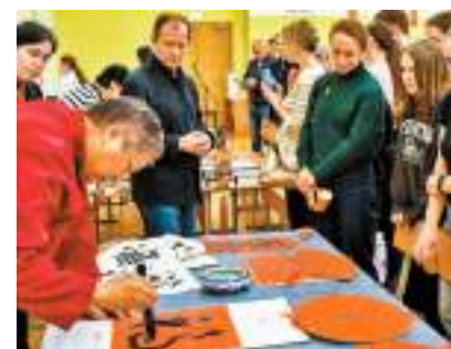
世界越是動盪不安，中俄關係越應穩步向前。圖為在莫斯科國立人文大學孔子學院，人們觀看書法家寫「福」字。