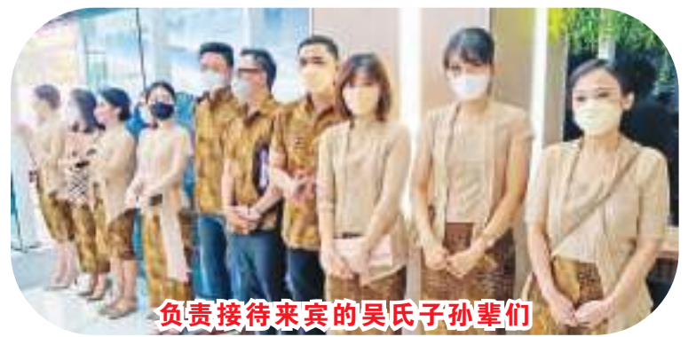
负责接待来宾的吴氏子孙辈们