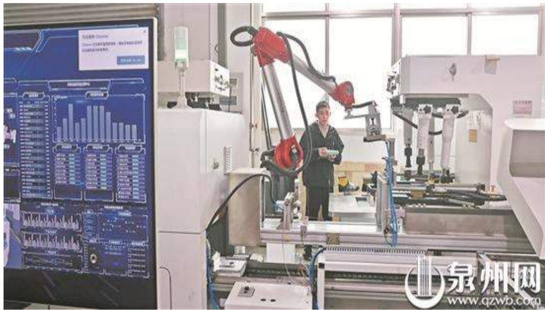
泉州華中科技大學研究院技術人員正在調試機器人柔性制鞋成型生產綫

泉州網訊(記者謝偉端)2日,在位於泉州開發區的泉州華中科技大學智能制造研究院,技術人員正加緊調試一條機器人柔性制鞋成型生產綫,準備發往莆田的客戶。這項集合了中國工程院院士周濟等專家團隊力量、歷時5年研發出來的成果,於近年得到全面落地產業化應用,並於去年底入選福建省首臺(套)重大技術裝備認定名單。