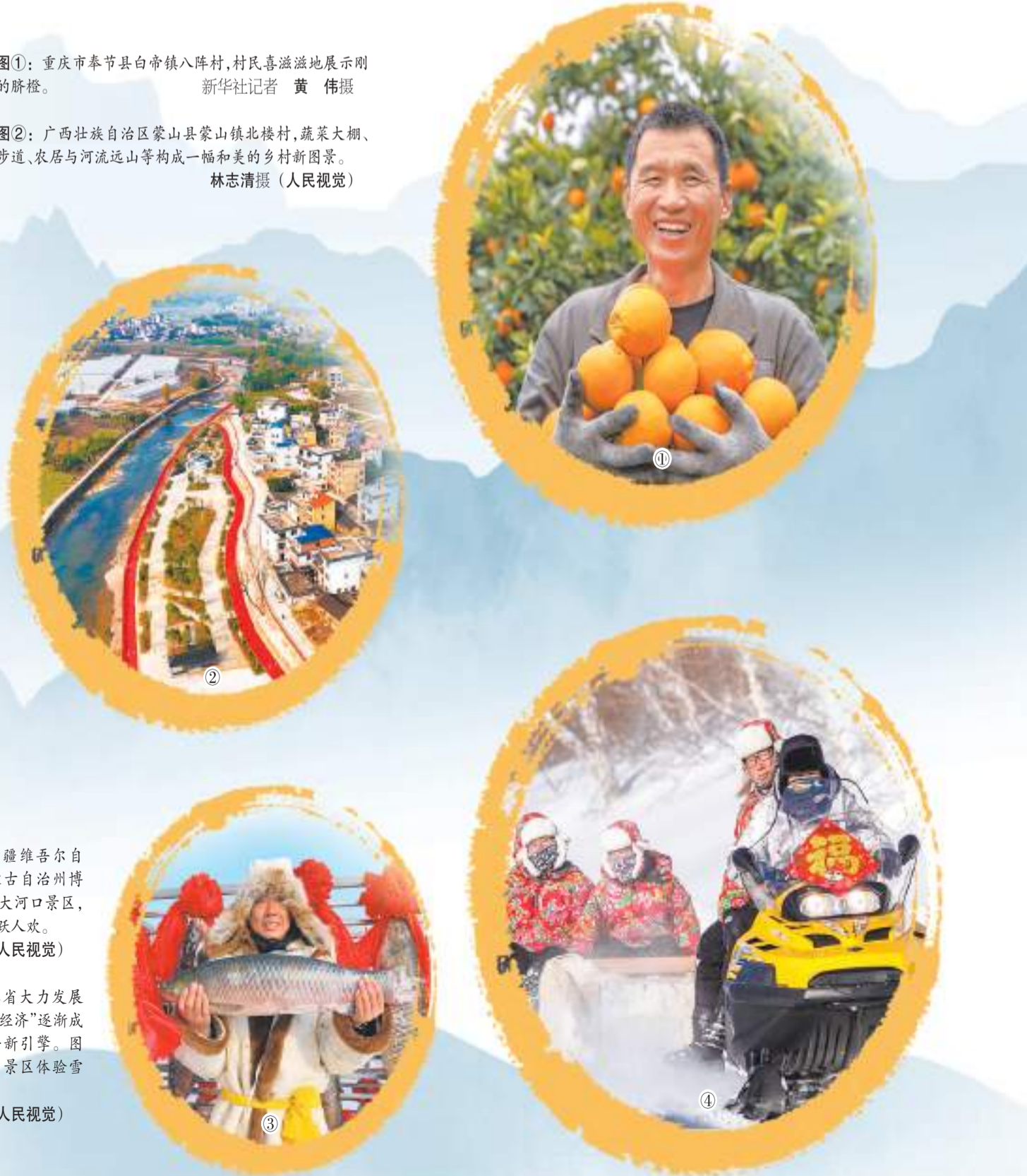
图④：吉林省大力发展冰雪产业，“冰雪经济”逐渐成为当地乡村振兴新引擎。图为游客在长白山景区体验雪地摩托的乐趣。