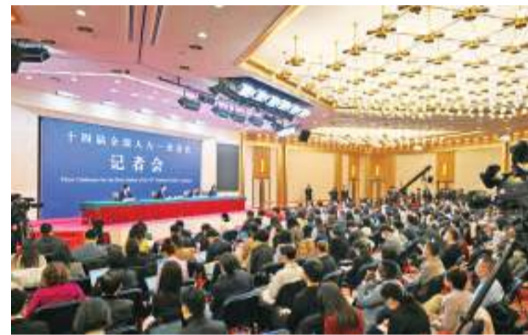
3月7日,记者会现场。

今年,中方将举办第三届“一带一路”国际合作高峰论坛,我们将以此为契机,与各方一道推动共建“一带一路”取得更丰硕的成果。“一带一路”是务实开放的倡议,秉持的是共商、共建、共享原则,在合作中我们有商有量,在交往中我们重情重义,对于其他国家提出的倡议,只要不以意识形态划线,我们都欢迎,只要不夹带地缘政治的私货,我们都乐见其成。所谓“债务陷阱”这顶