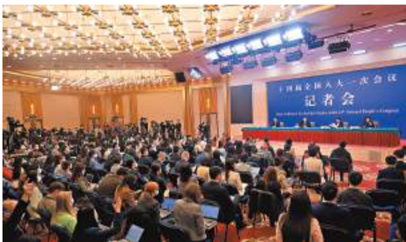
3月7日，十四屆全國人大一次會議在北京梅地亞中心舉行記者會，邀請外交部長秦剛就「中國外交政策和對外關係」相關問題回答中外記者提問。