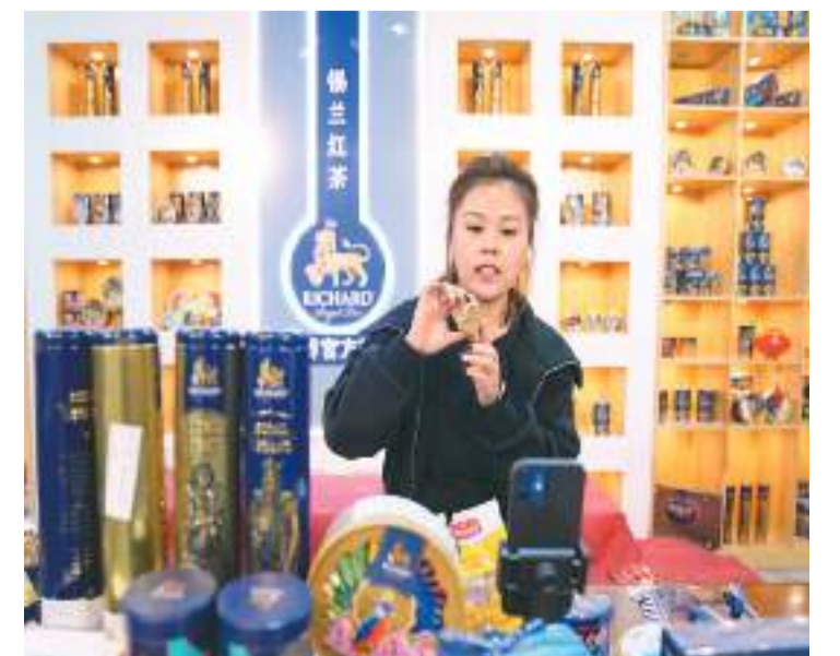
商家在黑龙江绥芬河跨境电商创客孵化基地进行直播。

业内人士认为，跨境电商业务是扩大优质产品进口、促进消费提质升级的创新实践，在丰富商品供给的同时，展现不同国家的文化特色和生活方式，使国内消费者足不出户即可购买来自世界各地的品质好物，体验当地特色风情。