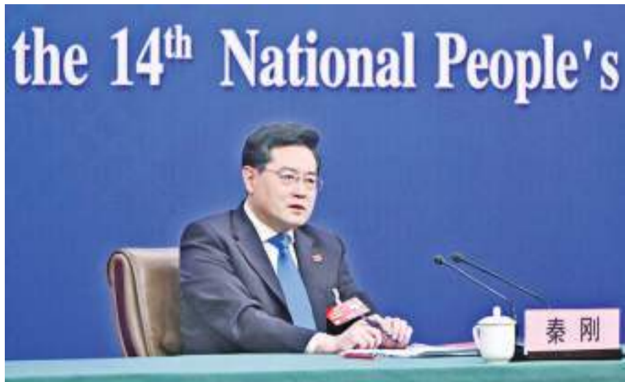
3月7日,十四届全国人大一次会议在北京梅地亚中心多功能厅举行记者会,外交部长秦刚就“中国外交政策和对外关系”相关问题回答中外记者提问。

【本报记者张善萍北京专电】每年两会的外长记者会都是最受关注的。3月7日是秦刚作为新任外交部部长的身份首次亮相全国两会,300多位中外记者一大早,至少提前三、四小时在梅地亚中心门外排队。据观察,外媒记者占一半左右,可见世界对于这场外长记者会高关注度。在时长1小时50多分钟的记者会上,秦刚就“中国外交政策和对外关系”相关问题回答中外记者提问。问题聚焦中美关系、中俄关系、俄乌战争、一带一路等热点议题。