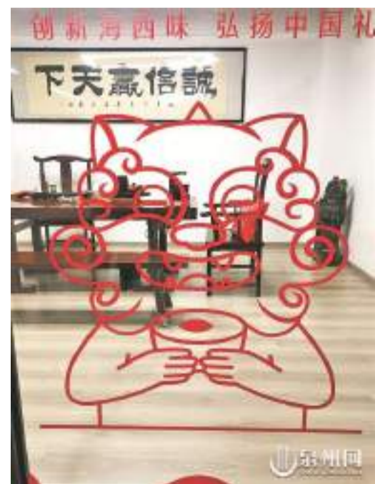
茶室門口,紅色彩紙剪裁的“敬茶獅”手捧茶杯,笑臉迎客。

結於茶文化中的“福獅”文化也煥發出盎然生機,以源源不斷的創新力,傳遞東方韻味,傳播海絲故事,向五湖四海的賓朋,帶去故鄉的真誠問候。