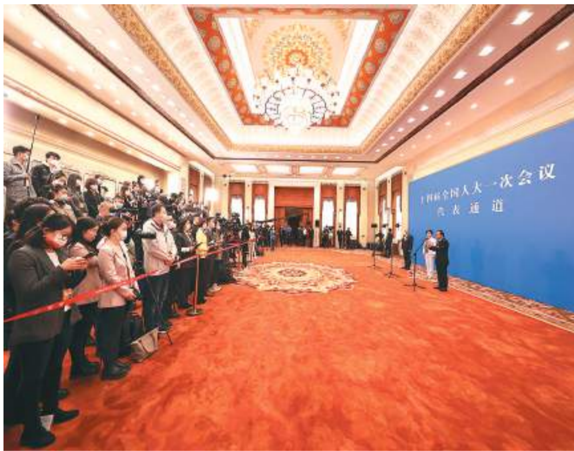
▲第十四届全国人民代表大会第一次会议“代表通道”活动现场，代表们在回答记者提问。