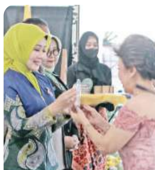
赠送纪念给嘉宾致谢