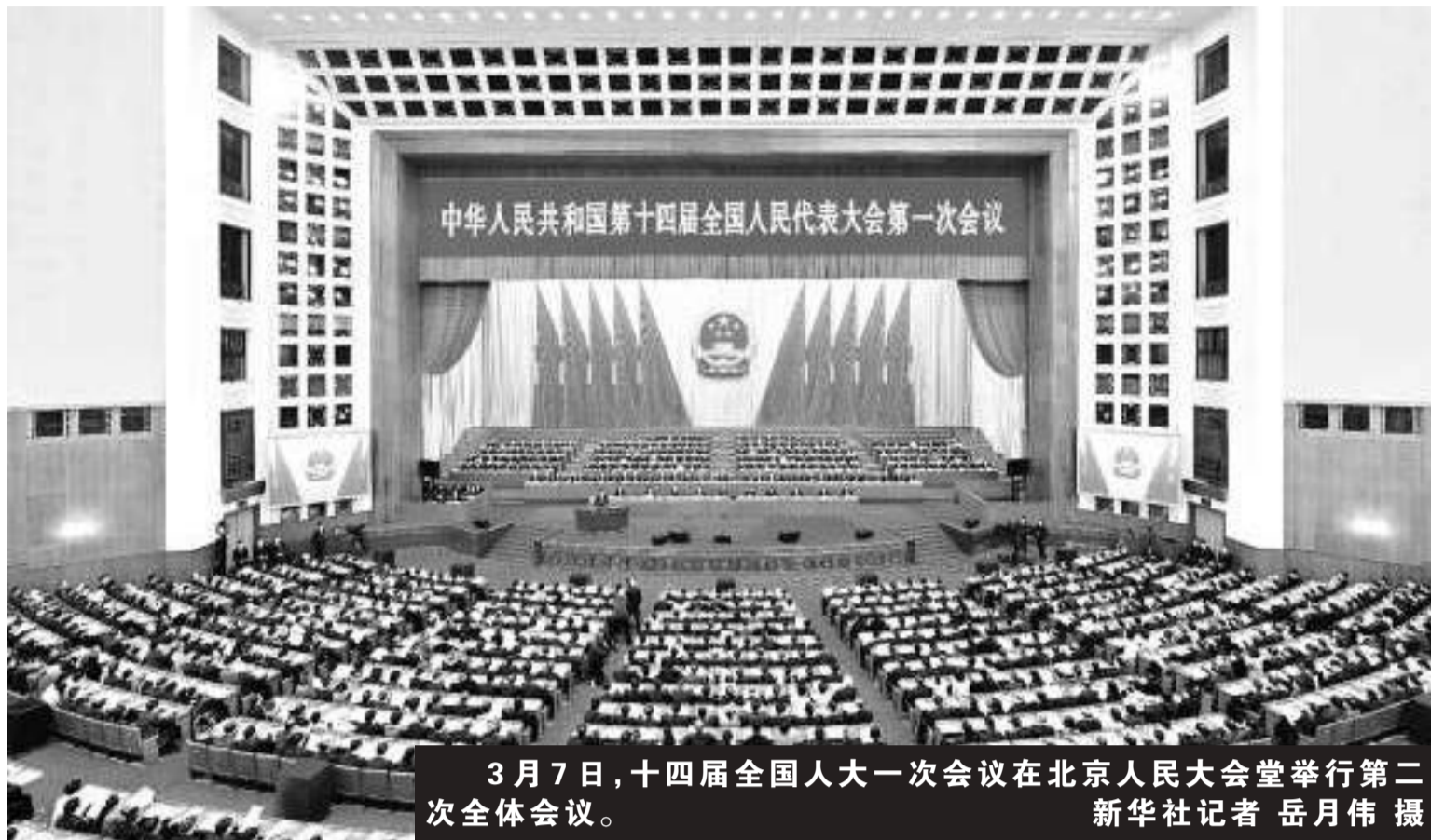
3月7日，十四届全国人大一次会议在北京人民大会堂举行第二次全体会议。