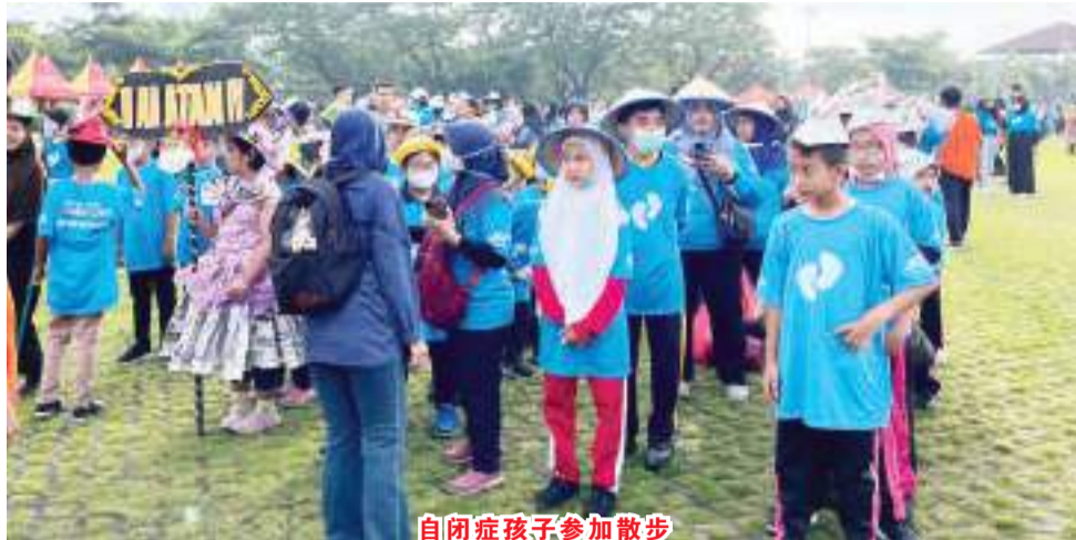
自闭症孩子参加散步