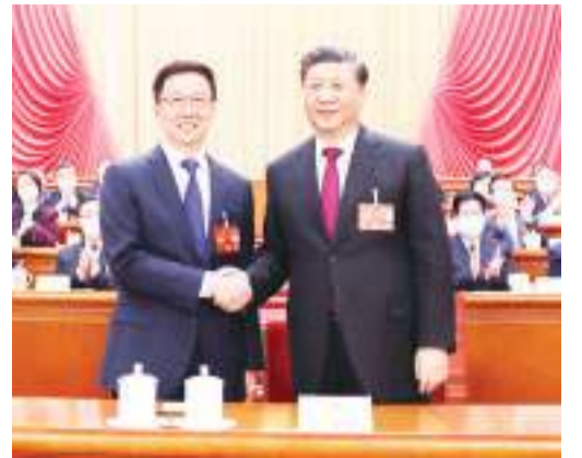
习近平同新当选的国家副主席韩正握手。