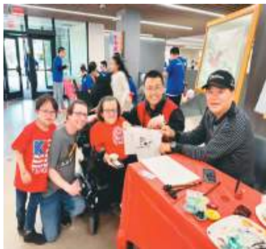
图为体验日活动现场。

近日，第三届亚利桑那州汉语及文化体验日活动在美国亚利桑那州立大学举行。该活动由亚利桑那州立大学国际语言学院、亚省现代中文学校和凤凰城国际友好城市协会共同主办。