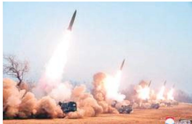
金正恩视察部队并观摩火力袭击训练。

金正恩对训练结果表示极为满意，并高度评价了火星炮兵的实战应对能力。他表示，检验性训练结果清楚地表明，“军队要随时做好能打仗、打胜仗的一切准备”。