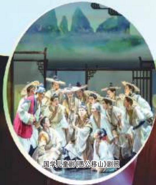
国学儿童剧《愚公移山》剧照