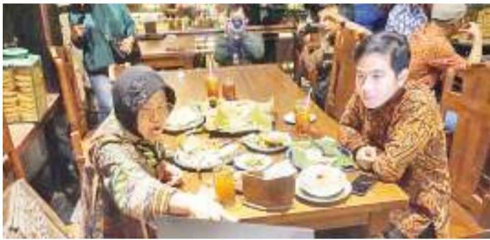
左起：丽斯玛和吉布兰

【本报讯】印尼斗争民主党秘书长哈斯托回应了在面临雅京专区省地方选举中，推选为省长候选人的人物的一些人的意愿。其中包括梭罗市长吉布兰、社会部长丽斯玛和雅京专区代省长赫鲁。 哈斯托日前表示，现在决定这些人物在雅京专区省地方选举参选还为时过早。这是因为印尼斗争民主党仅在2024年大选后，才确定雅京专区省长的候选人名单。当然什么人是在雅京专区省的省长候选人，与副省长的候选人，将在立法和总统选举后讨论的问题。 哈斯托指出，印尼斗争民主党是一个遵守原则，并重视斗争过程的政党，因此印尼斗争民主党将遵循选举过程的各个阶段。对于本党来说，政治是符合阶段的。根据该阶段设置耐力。高峰是在明年2月14日，立法选举和总统选举，只有在此之后，才是举行地方领导人选举。