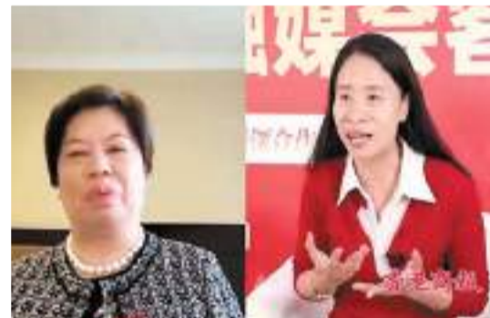
商報記者連線港區全國政協委員顏寶鈴。

投資建廠，當時員工才100多人，工廠所在的村莊也才400人，不通水、不通電。現在，她的企業員工已有1萬多人，小小村莊變成4萬多人的大集鎮。