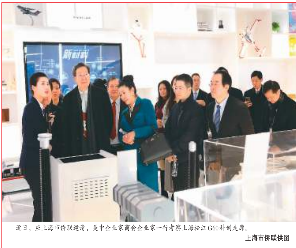
近日，应上海市侨联邀请，美中企业家商会企业家一行考察上海松江G60科创走廊。

今年以来，中国优化调整疫情防控措施，中国经济回升态势日益明朗，各地侨乡积极搭台架桥，筑巢引凤，吸引海外侨商回国投资兴业。新订单、新项目、新投资……海外侨商带来接二连三的好消息，为侨乡增添更多暖意。