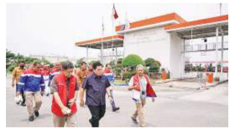
埃里克探访储油库爆炸案受害者

【本报讯】3月4日(星期六)，国企部长埃里克表示，处理伯伦邦(Plumpang)北塔米纳储油库火灾的受害者，是国企部和北塔米纳(PT Pertamina)的优先事项。自周五(3/3)晚上事件发生以来，北塔米纳公司一直有所担当，为受火灾影响的民众提供援助。