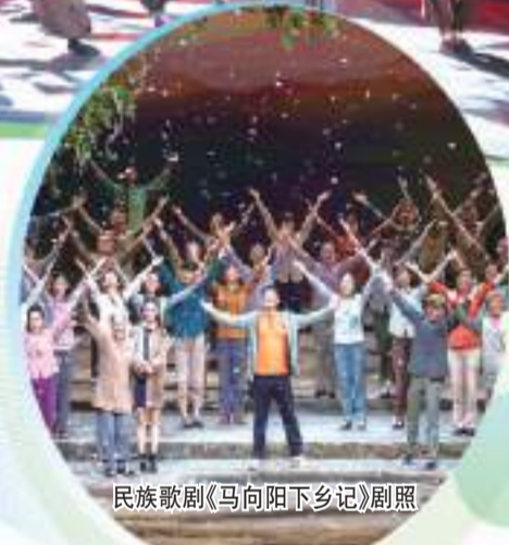
民族歌剧《马向阳下乡记》剧照

新春伊始，青岛演艺集团大戏好戏轮番上演。大年初二，儿童剧《小蝌蚪找妈妈》开启春节贺岁档首场演出，《工匠·鲁班》《皇帝的新装》等儿童剧，《乐激扬》2023新春流行演唱会《2023新春交响音乐会》《玉兔迎春》相声小品晚会等，《野猪林》《扈家庄》《失·空·斩》京剧名家名段演唱会等京剧……34场形式多样的文艺演出丰富了青岛市民文化生活。接下来，还将陆续上演“春之景”折子戏专场《三岔口》《春闺梦》《游龙戏凤》，民族歌剧《马向阳下乡记》，致敬新时代工匠精神的现代京剧《东方大港》等。这些高水准的精品演出，为市民献上精彩纷呈的文化盛宴。