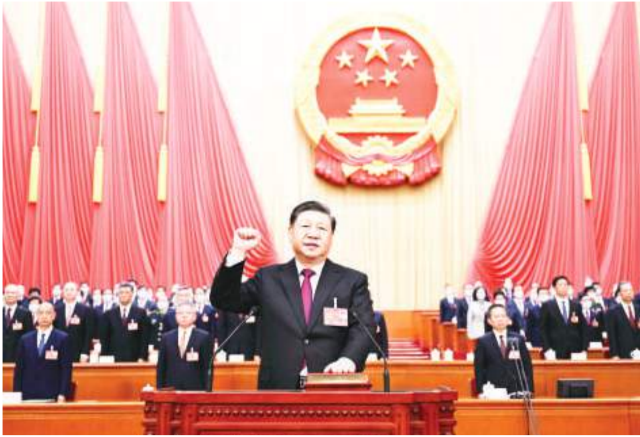
习近平全票当选为中华人民共和国主席、中华人民共和国中央军事委员会主席。这是习近平进行宪法宣誓。