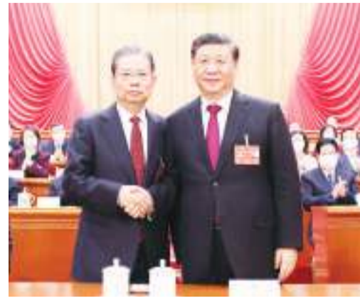
习近平同新当选的全国人大常委会委员长赵乐际握手。