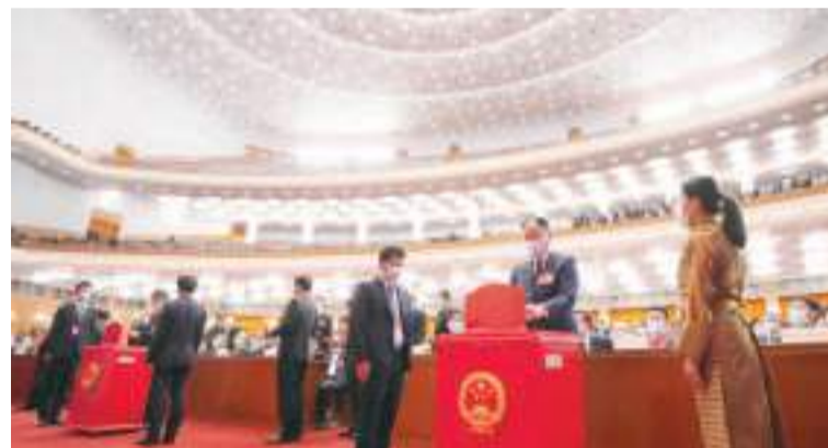
十四届全国人大一次会议在北京人民大会堂举行第三次全体会议。这是代表在投票。