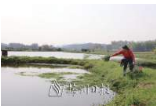
村民在給魚投喂草料。

農民增收的有效途徑之一。”梅縣區農業農村局漁業發展股股長賴春濤表示，下一步將把瑤東村“稻魚輪作”試驗基地打造成示範點，在全區合適的地方推廣該模式，讓田無“閑”、讓田增“產”、讓田有“財”，增加農民收入。(本報記者 吳麗玲)