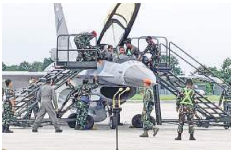
国防部长普拉波沃参加F-16型战斗机的飞行

他透露要成为一名飞行员，尤其是战斗机的飞行员飞行的反应，如果有来自外部的干扰，我们的指挥官肯定会做出决定。这只是几分钟的事情。