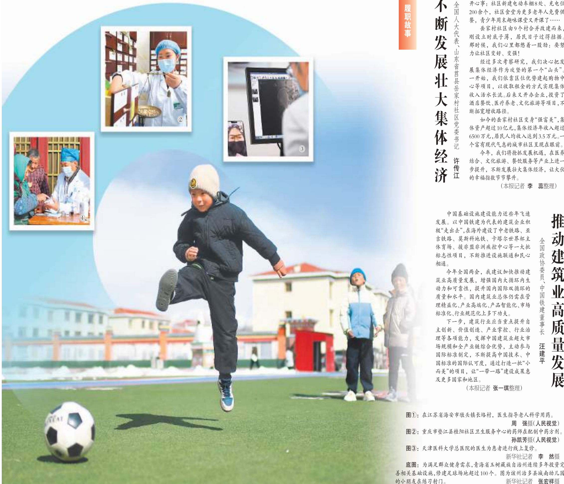
底图：为满足群众健身需求，青海省玉树藏族自治州连续多年投资完善相关基础设施，修建足球场超过100个。图为该州治多县城南幼儿园的小朋友在练习射门。