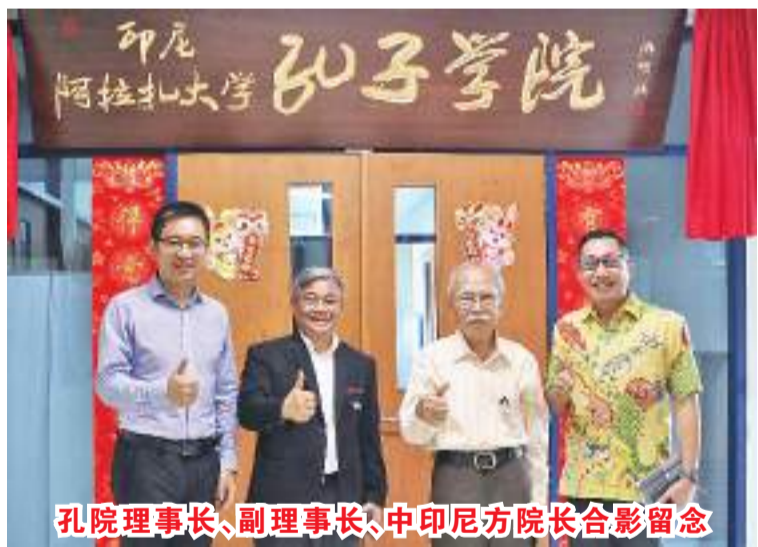
孔院理事长、副理事长、中印尼方院长合影留念

阿拉扎大学孔子学院成立于2010年11月9日,由中国福建师范大学与印尼阿拉扎大学共建,是印