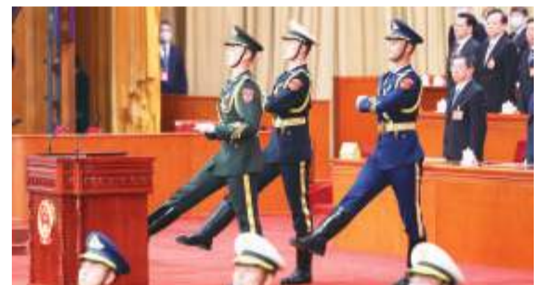
主席台上，3名礼兵迈着正步护送《中华人民共和国宪法》入场。