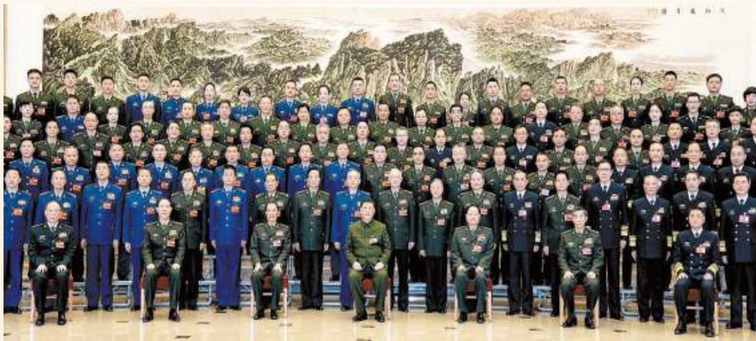
3月8日下午，中共中央總書記、國家主席、中央軍委主席習近平出席十四屆全國人大一次會議解放軍和武警部隊代表團全體會議。這是會議開始前，習近平親切接見代表團全體代表，並同大家合影留念。