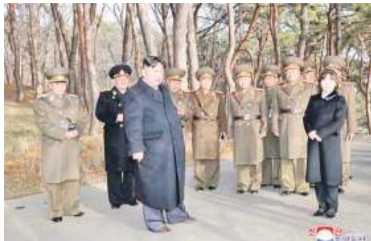
金正恩携女儿视察部队并观摩火力袭击训练。