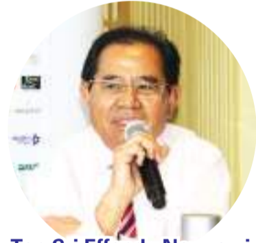
Tan Sri Effendy Norwawi