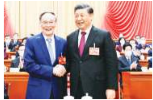
习近平同王岐山握手。