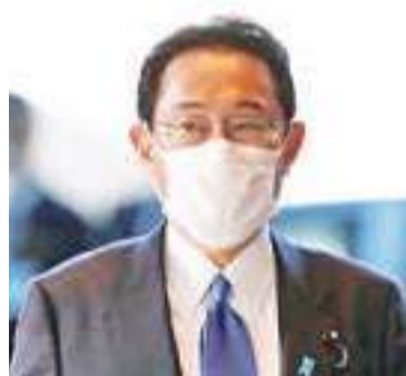
日本首相岸田文雄

按照规程，北约必须在30个成员国“一致同意”前提下才能吸纳新成员。目前，土耳其和匈牙利尚未正式批准瑞典和芬兰加入北约。