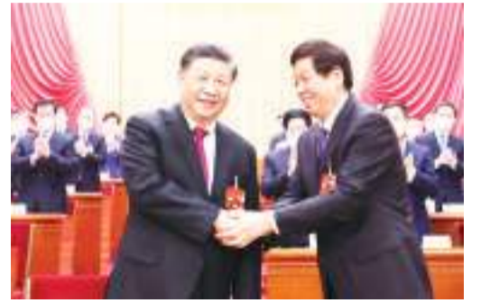
习近平同栗战书握手。

【本报记者张善萍北京专电】3月10日，第十四届全国人民代表大会第一次会议选举产生国家领导人。习近平全票当选中华人民共和国国家主席、中央军事委员会主席，开启第三个国家元首