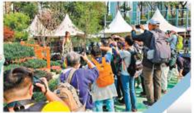
多名攝影愛好者到場捕捉倩影。