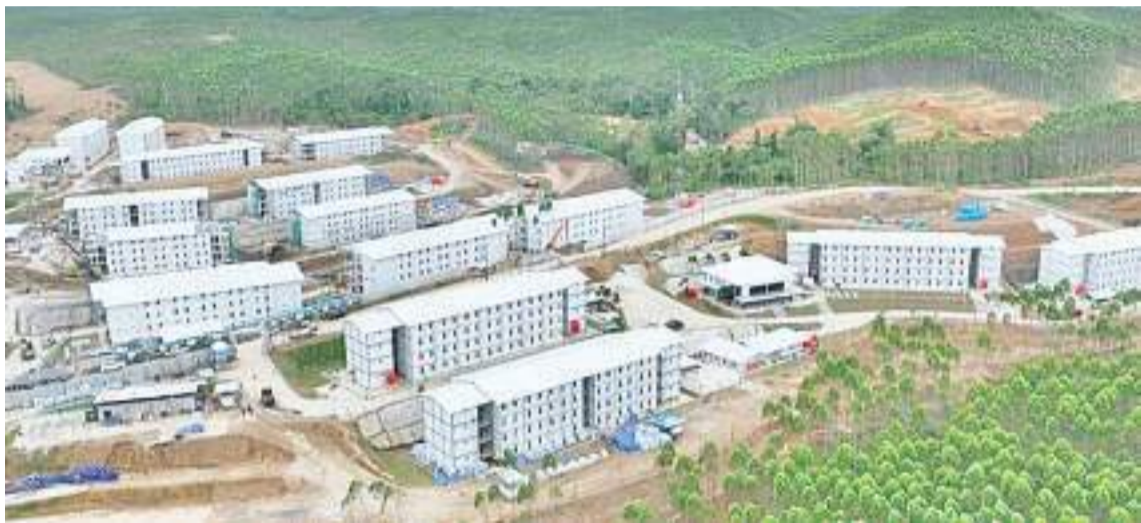
新国都努山达拉已经建成的22座塔楼居住区

【本报讯】3月8日，国务秘书处官网上宣称，佐科维总统已于3月6日签发了12/2023号政府条例，其中规定了在新国都努山达拉为企业颁发营业执照、营商便利度和投资设施，以及允许外劳在新国都工作等政策。