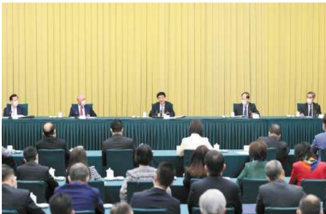
3月8日，中共中央政治局常委、全國政協十四屆一次會議主席團會議主持人王滬寧參加港澳地區全國政協委員聯組會。

【香港商報訊】兩會報道組北京報道：中共中央政治局常委、全國政協十四屆一次會議主席團會議主持人王滬寧昨日上午參加港澳地區全國政協委員聯組會。當天中午，港區全國政協委員蔡冠深等舉行記者會介紹稱，王滬寧對香港、澳門和港澳政協委員提出「四點希望」：一是希望落實好「一國兩制」，落實好「愛國者治港」、「愛國者治澳」；二是希望大家抓住機遇，同國家同步，發展好經濟；三是希望解決好土地房屋等民生問題；四是希望講好中國故事及港澳故事，要將「一國兩制」成功案例告知全世界的朋友。