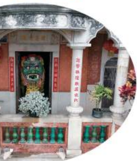
▲沙美鄉武術館的青獅在萬安樓二樓大門“尚武精神”樓聯旁展示中華武魂。