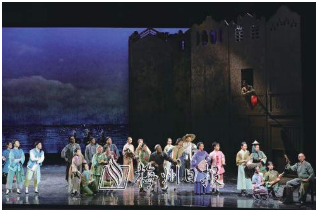
廣東漢劇傳承研究院深入生活、扎根人民，推出了眾多精品力作。圖為《天風海雨梅花渡》展演現場。

近年來，從創排新編大型現代廣東漢劇《李堅真》《酒鄉紀事》《虎口紅綫》《章臺青柳》到《天風海雨梅花渡》；小戲精品《山村夜話》《六棵柚子樹》《五個銅板》