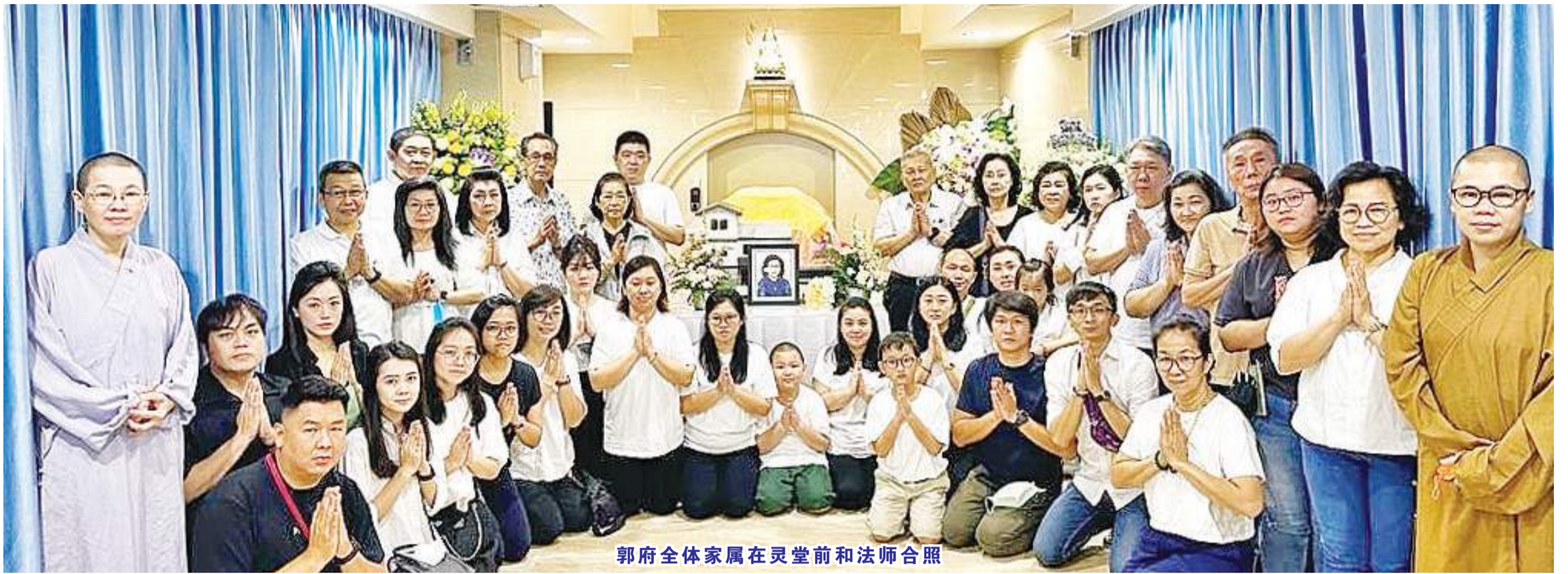
郭府全体家属在灵堂前和法师合照