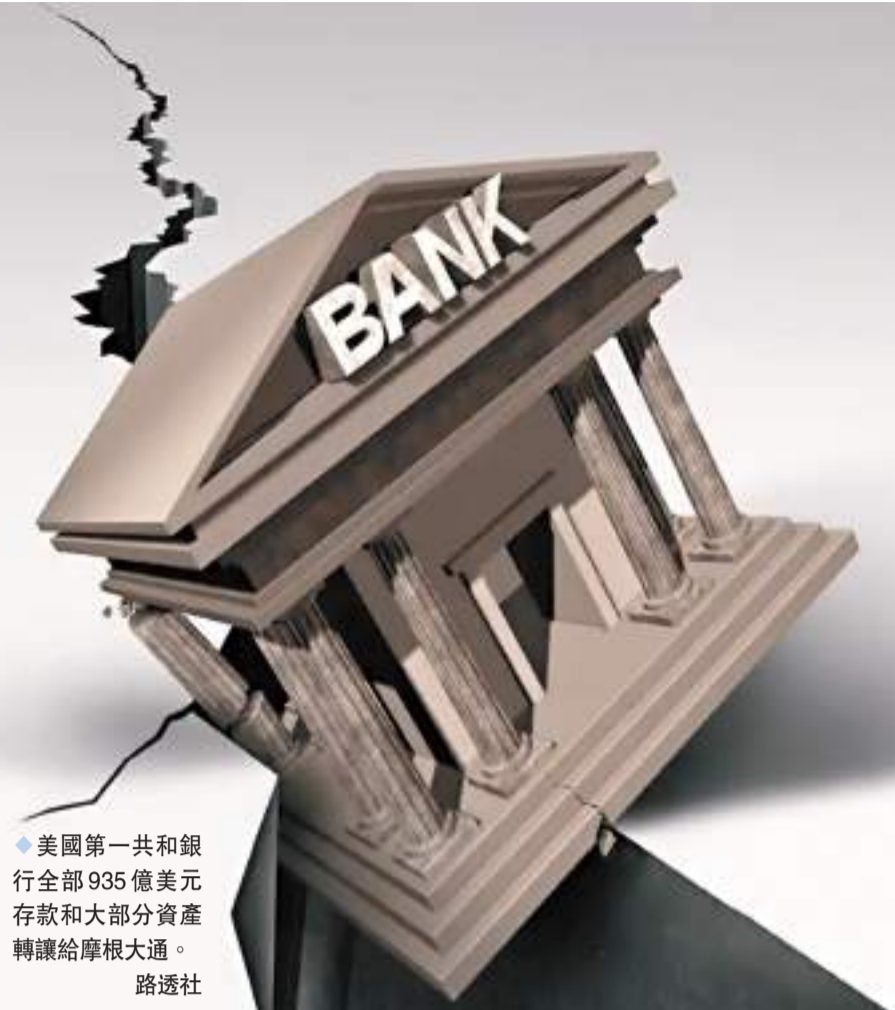
美國第一共和銀行全部935億美元存款和大部分資產轉讓給摩根大通。

截至上月中,FRB總資產約為2,291億美元。FDIC上周邀請6間金融機構參與收購FRB,最終接受摩通的收購建議。摩通除接收FRB所有存款及合格金融合同外,亦購入FRB幾乎所有資產,同時承擔部分負債,與FDIC共同分擔損失。