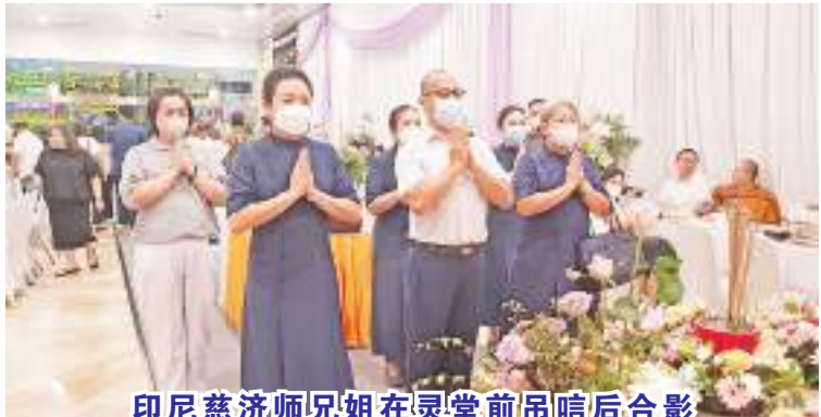
印尼慈济师姐妹在灵堂前吊唁后合影