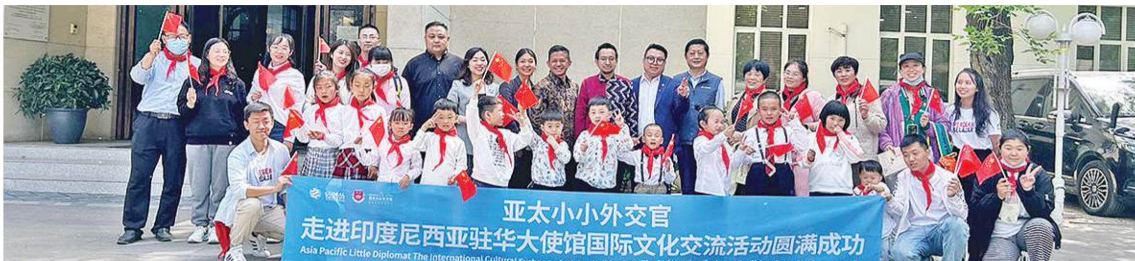
“小小外交官”在印尼驻华使馆前合影

此次“亚太小小外交官走进印尼大使馆”活动由“亚太小小外交官”组委会主办，选拔了一批全国优秀的青少年不定期前往各国大使馆感受驻华使馆风采的同时，学习外交知识和国际礼仪并开拓国际视野。今年暑期“亚太小小外交官”组委会也将与巴厘岛旅游局官方合作，秉承“一带一路”政策前往“一带一路枢纽站”巴厘岛，进行一系列文化交流及研学活动。