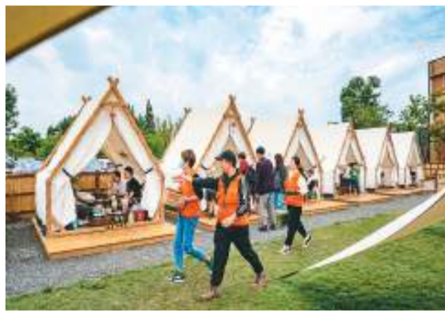
“五一”假期，位于滇池南岸的云南省昆明市晋宁区上蒜镇小渔村热闹非凡，避开热门景区到城市近郊赏景游玩、露营烧烤、体验乡村生活成为不少市民假期出游新选择。图为4月30日，工作人员在小渔村内为游客上菜。