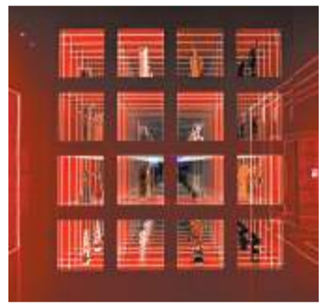
張國榮歷年來贏得的歌影視獎項。

為紀念這特別時刻，博物館為這位第十萬名觀眾準備了別具心思的禮物，包括附有三位客席策展人：張國榮生前摯友陳淑芬、張叔平及夏永康簽名的展覽海報，以及香港電影資料館「芳華再續」專題放映活動電影門票，並由康樂及文化事務署署長劉明光及陳淑芬親自送上。陳太更將原本扣在她自己衣服上的紙鶴飾物送給這位女孩，並親自為她扣上，令女孩感到喜出望外。