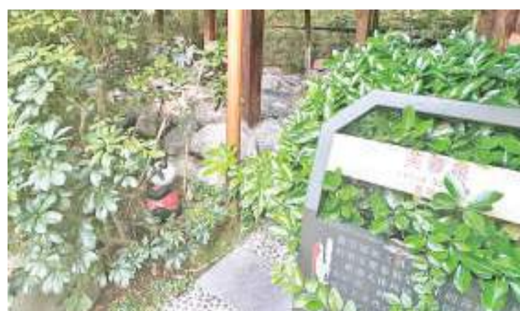
麓棠温泉酒店的天然地热温泉