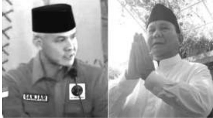
左起：甘贾尔和普拉波沃

【本报讯】目前盛传有关大印尼行动党总主席普拉波沃将与甘贾尔配对担任副总统候选人的构思。 就有关此事，普拉波沃表示不想做出假设两人之间存在成为搭档的构思。 因为，目前普拉波沃已被提名为大印尼行动党的总统候选人。 4月22日，普拉波沃表示，本党提名我为总统候选人，现在大印尼行动党有点强大。