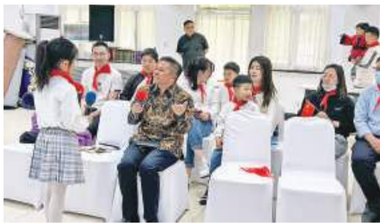
“小小外交官”向李健参赞提问

戴德明首先向各位小小外交官们介绍了印尼的历史文化、风土人情及传统美食，提出中印尼经济合作发展的强劲趋势，作为中国的莘莘学子们更是发展中印尼关系的坚强后盾；李健也谈到今天是个特殊的日子——印尼“国家教育日”，印尼政府一直倡导“Merdeka Belajar(自主学习)”，也希望更多的中国“小小外交官”们能够走进印尼，真正地在实地感受和考察印尼丰富多彩的文化。