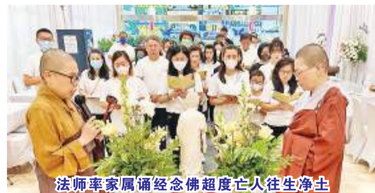
法师率家属诵经念佛超度亡人往生净土