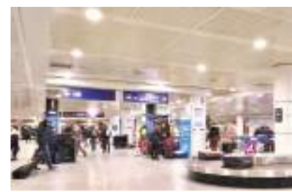
墨西哥人被指利用免簽證待遇飛抵加拿大,然後潛往美國。

聯邦移民、難民及公民部長弗雷澤的發言人表示,加拿大、美國與墨西哥緊密合作應對各種共同面對的挑戰,包括邊境安全。他指出加拿大一直監視墨西哥人非法入境美國的趨勢,但政府目前沒有計劃對墨西哥人重新實施簽證要求。