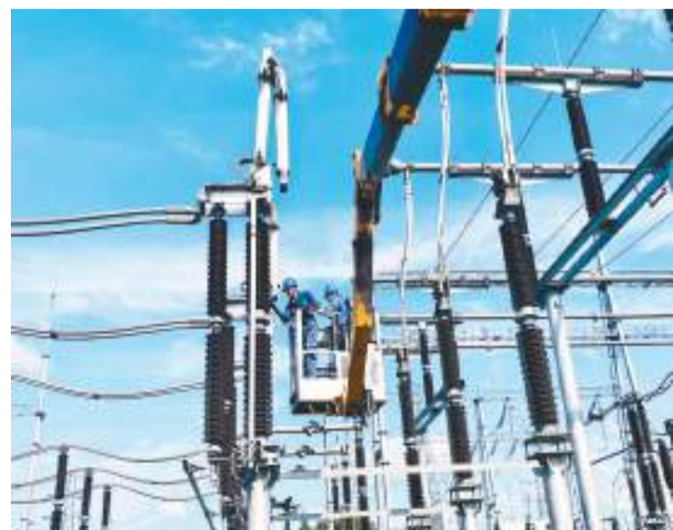
“五一”假期，在广西壮族自治区钦州市钦南区金窝工业园区，南方电网广西钦州供电局变电检修人员正在对辖区内的第一座数字化变电站——220千伏排岭变电站的设备进行检修维护，以提高设备健康水平，确保西部陆海新通道骨干工程平陆运河项目建设用电安全可靠。