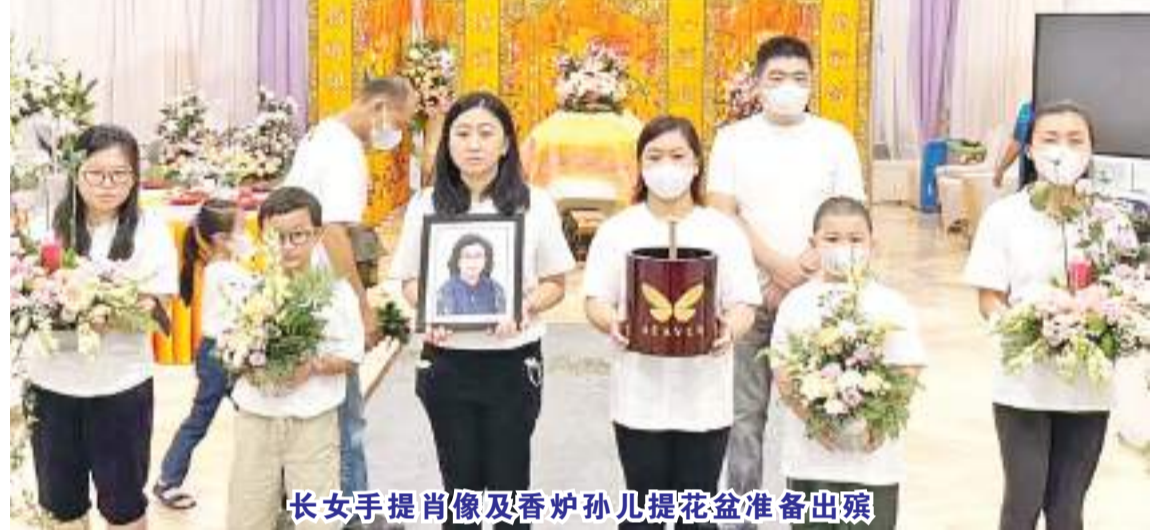
长女手提肖像及香炉孙儿提花盆准备出殡