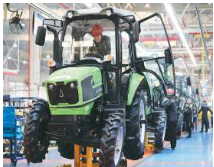
今年一季度，山东省临沂市临沭县农业机械出口同比增长15%。近年来，当地补强高端装备制造产业链条，实现了传统农机装备制造向数字化、智能化、信息化转变，多种农业机械畅销海外。图为山东道依茨法尔机械有限公司的生产车间，一批拖拉机正在下线。

据悉，天能集团和长兴县新川村共同打造了“企业引领、产业带动、集体增收”的“村企共建”新模式。2021年，天能集团和新川村合作成立了3家村企合办的“共同富裕公司”，村民在家门口实现文旅、投资致富。2022年，新川村集体经济收入达885.48万元，村民人均可支配收入超过15万元。2019年新川村成立乡贤会，为美丽乡村建设赋能。现在，新川村乡贤创办的各类市场主体达80个。