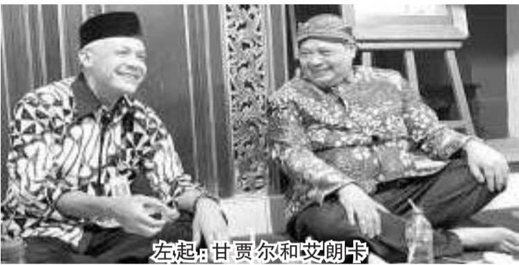
左起：甘贾尔和艾朗卡

【本报讯】伊斯兰与民主研究中心政治观察员纳沙尔(Nazar EL Mahfudzi)预测，艾朗卡有很大的机会成为甘贾尔在2024年大选中的副总统候选人。这是因为，艾朗卡担任从业党总主席，该党是佐科维