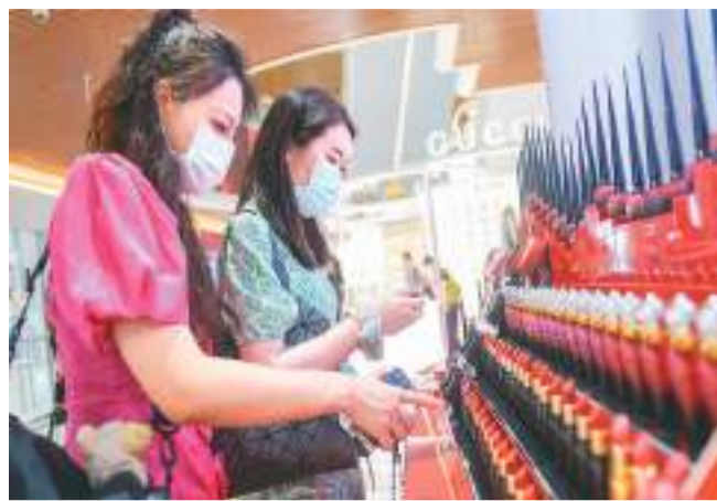
5月1日，海南省海口日月广场海控全球精品免税城内，消费者在选购免税商品。“五一”节期间，海口各大免税店线上、线下推出折扣、满减、返券、发放现金券等优惠促销活动，多措并举激发离岛免税消费热情。

“五一”消费回暖的背后，是“动起来”的人潮。中国国家铁路集团有限公司发布的信息显示，4月27日至5月4日，全国铁路预计发送旅客1.2亿人次，较2019年同期增长20%，超历史同期最高水平，日均发送旅客1500万人次。同时，公路、民航客流亦持续高位运行。