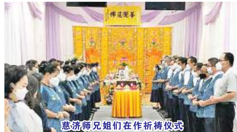
慈济师姐妹们在作祈祷仪式