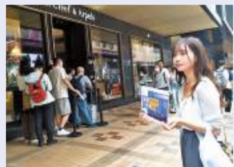
◆不少保險代理在旅遊旺區主動出擊「吸客」。

香港年初與內地復常通關，參考保險公司近期公布業績，在香港市場業務表現上均「報喜」。其中友邦上周公布最新業績，香港新業務價值首季取得「卓越的」雙位數增長，主要是由本地客戶群及客戶對長期儲蓄產品強勁的需求推動，其中包括自2月全面通關後向內地旅客的銷售。至於保誠首季香港新業務利潤亦按年升1.06倍，保誠在業績中更形容，香港恢復通關後，內地旅客的銷售額「重現生機」。