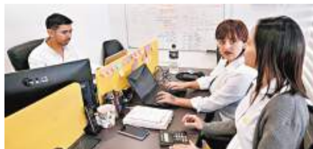
大量行政類工作職位將被AI系統取代。

不過在2020年受訪僱主曾估計到2025年會有47%工作,可透過自動化科技完成,但今年的報告中,他們估計到2027年仍只會有42%工作自動化,進度比原先估計的慢。很多公司認為能夠有效運用AI工具,比懂得電腦編程是更有價值的技能。