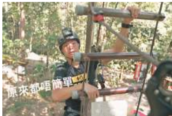
今次奶仔同團隊齊齊衝出香港。

佢覺得個個嘅咁多嘢講又幾得意，所以就做咗朋友。所以一知道要去馬來西亞就即刻打去問佢願唔願意嚟拍。其實佢都唔知我拍咩嘍，同埋佢平時好怕辛苦，今次佢同我一齊郊遊都非常開心。」