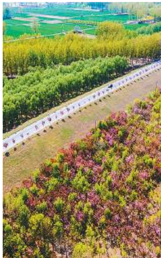
河南封丘地段黄河大堤生态环境美如画。