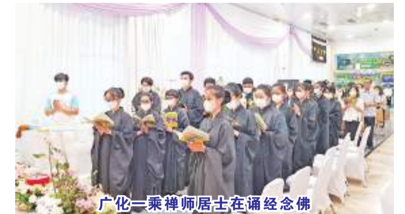
广化一乘禅师居士在诵经念佛