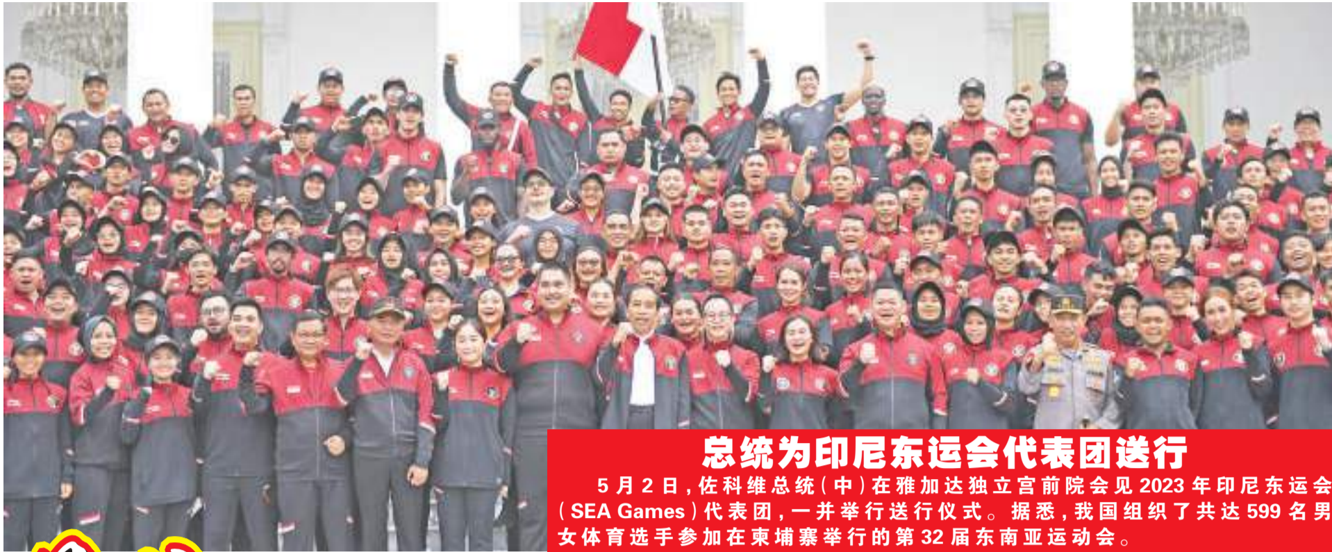
总统为印尼东运会代表团送行 5月2日,佐科维总统(中)在雅加达独立宫前院会见2023年印尼东运会(SEA Games)代表团,一并举行送行仪式。据悉,我国组织了共达599名男女体育选手参加在柬埔寨举行的第32届东南亚运动会。