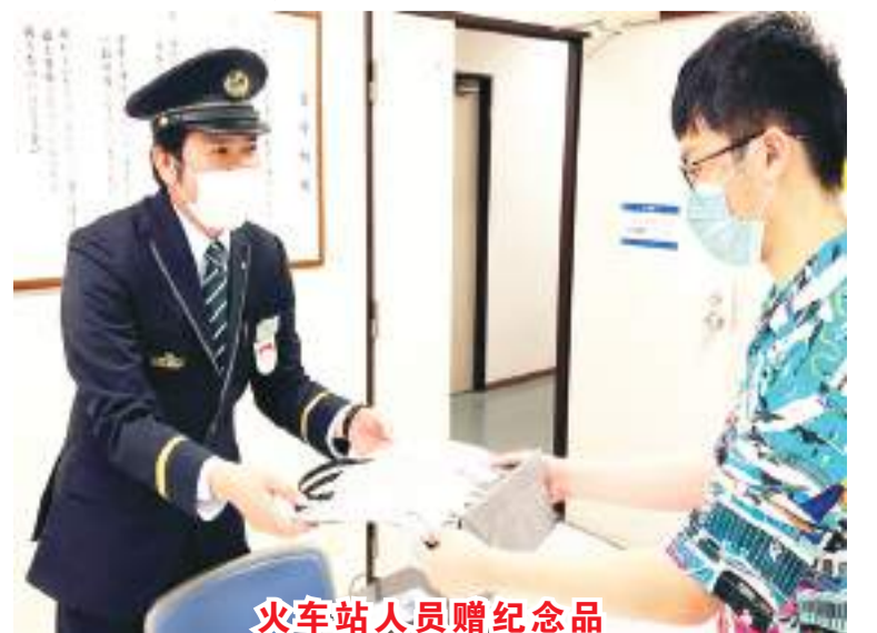
火车站人员赠纪念品