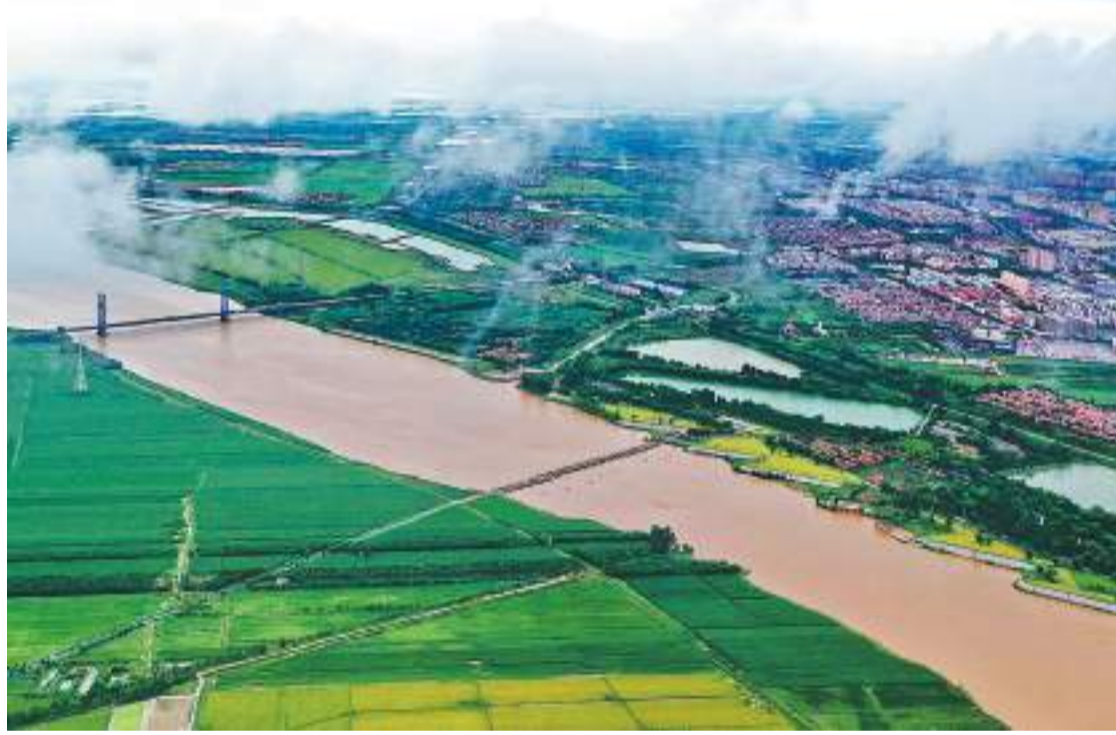
左图：黄河穿过东营城。

波澜壮阔的黄河发源于青藏高原的唐古拉山，流经青、川、甘、宁、蒙、陕、晋、豫、鲁九省区，自西向东奔流入渤海，是中华民族的母亲河，也是中华文明的摇篮。