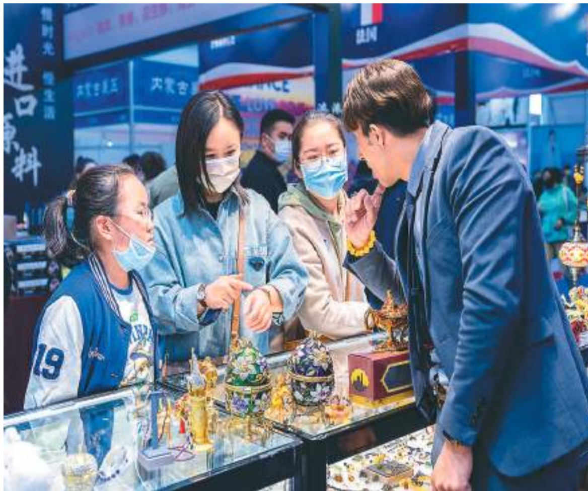
为期5天的“第八届中国·内蒙古进出口商品博览会”4月28日在内蒙古国际会展中心举行。本届展会展出面积约8000平方米，设国际标准展位260余个、特装展位10个，吸引来自俄罗斯、巴基斯坦、印度、蒙古国等多个

海关总署相关负责人表示，开展促进跨境贸易便利化专项行动，是对标国际先进水平，全力营造市场化、法治化、国际化一流口岸营商环境的重要举措。今年将进一步将经济大省重点城市纳入先行先试范围，有助于提升专项行动影响力和实施成效。同时，随着这些改革创新举措落地生效，将进一步惠企利民，更好地服务外贸促稳提质。