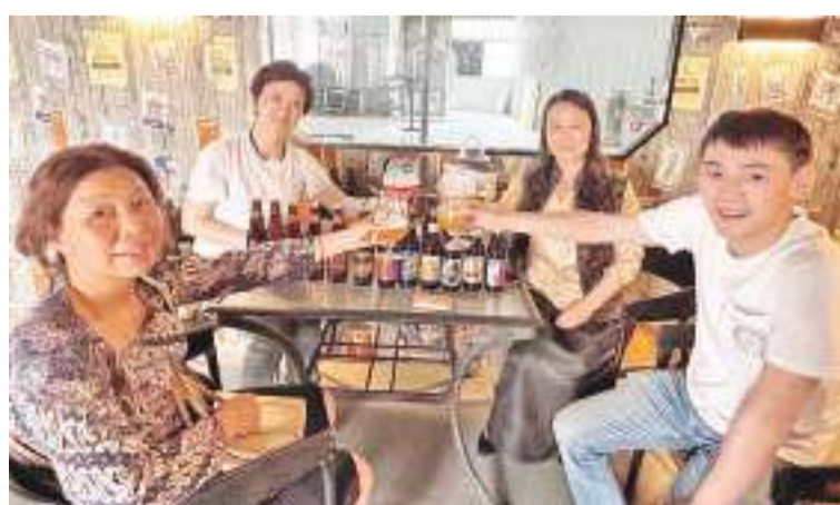
客人们在品尝精酿“蜀啤”