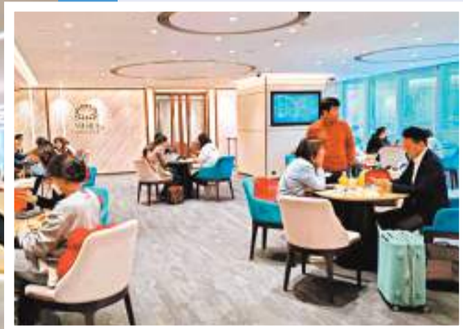
◆因看好保障範圍廣、性價比高和有紅利回報，許多內地客湧入香港購買保險。圖為保誠簽約大廳。