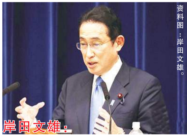
岸田文雄:计划自5月7日起访问韩国

府撤离了100名工作人员后,美国公民却只能自救多福,在苏丹滞留了两周,这种情况令人深感不安。这是一个巨大的问题,苏丹冲突持续,人们没有食物和水了。 4月27日,美国福克斯新闻网发表文章说:“全世界其他国家在安全撤离本国公民时,美国却声称苏丹太危险无法撤离。”指责美国政府只顾着撤离外交人员,把本国公民抛下不管。 有网友指出:“海豹突击队先救出那些卑鄙小人,然后他们上演了一场撤离表演,跟越南和阿富汗很像。”“和阿富汗一样,他们(美国公民)中的大多数会被抛下。”