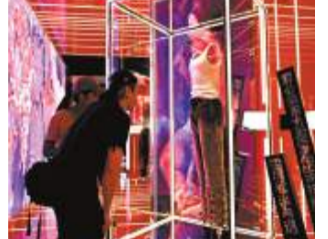
觀眾參觀張國榮在《熱·情演唱會》時穿著的套裝。