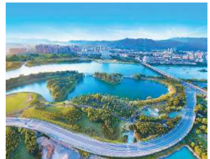
浙江省台州市天台县高度重视县委关于环保问题巡视意见，持续推进垃圾、污水、厕所三大项目治理，通过专业的规划建设，打造美丽、特色、绿色的和美村庄，助推乡村振兴。图为天台县始丰溪湿地公园俯瞰。

2023“长江主题旅游海外推广季”由中外文化交流中心联合上海、江苏、安徽、江西、湖北、湖南、重庆、四川、贵州、云南等十省（市）文化和旅游主管部门，联动驻外使领馆、海外中国文化中心和驻外旅游办事处等机构共同举办，围绕“守护黄金水道 促进绿色发展”的主题，向国际社会讲好长江故事，展示长江流域生态文明建设和可持续发展成果。