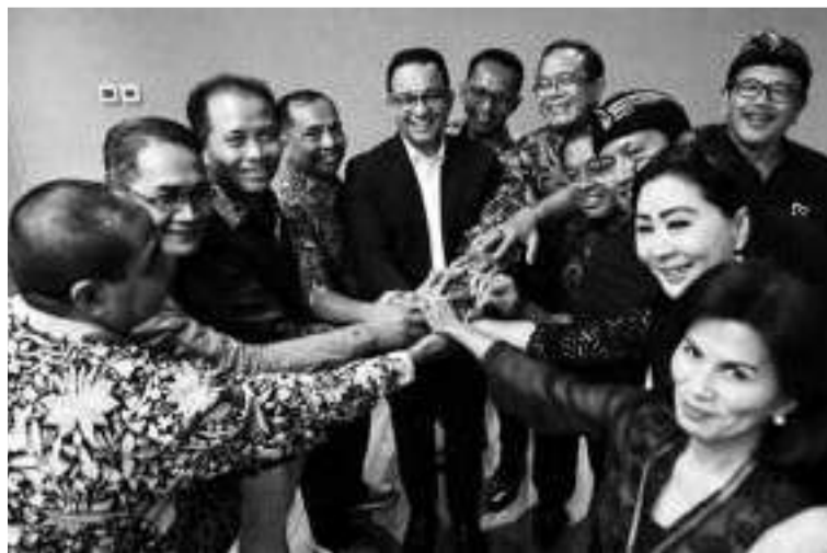
变革联盟总统候选人阿尼斯 (中)。

【本报讯】公正福利党变革联盟任由阿尼斯由辅导委员会副主席伊曼 (Sohibul Iman) 表示，团结