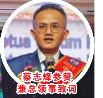
蔡志辉参赞兼总领事致词