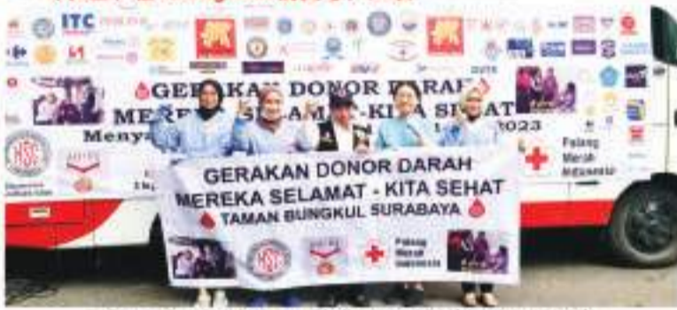
TAMAN BUNGKUL 365 BAG - 2 - 7 APRIL 2023 4月2日至7日, 在Taman Bungkul, 365袋