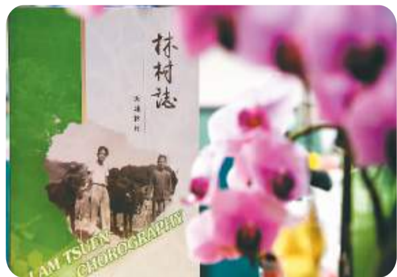
▲ 林禄荣参与编写的《林村志》。