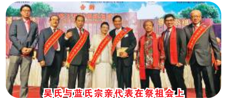
吴氏与蓝氏宗亲代表在祭祖会上