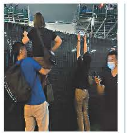
未能購票的粉絲不顧安全想爬牆進入會場。

周董一出場就跟大家打招呼:「香港!我回來了!」又以和朋友聊天的口吻說:「是不是很久沒見了?你們有想我嗎?」獻唱期間,歌迷與周董時而合唱、時而對唱,而周董還大展鋼琴、結他、古箏等樂器及舞蹈的才華,還為香港粉絲演唱自己寫給陳小春的歌《獻世》;而師弟曹格就擔任表演嘉賓。