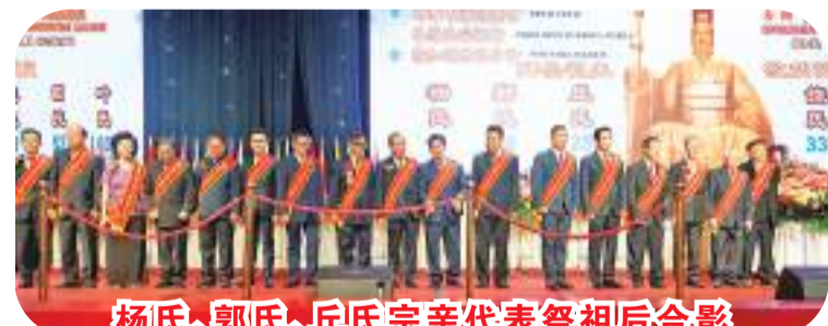
杨氏、郭氏、丘氏宗亲代表祭祖后合影