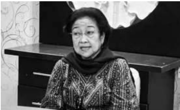
印尼斗争民主党主席梅加瓦蒂。

梅加瓦蒂指出，只要政党之间已经有一致的会面时间，进行政治沟通是非常重要的。印尼斗争民主党不承认“联盟”一词，而是政治合作。事实上，如果继续坚持使用“联盟”一词，就会混淆我国宪法坚持实行的总统制。这就是为什么会出现“总统门槛”，我们的宪法制度就是这样。团结建设党作为印尼斗争民主党的政治合作伙伴，也同意国家治理