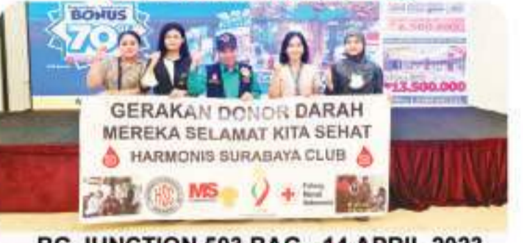
BG JUNCTION 503 BAG - 14 APRIL 2023 4月14日, 在BG Junction 购物中心, 503袋