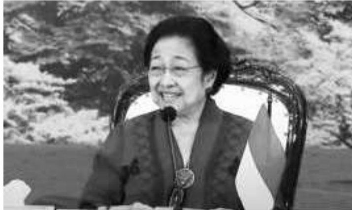
斗争民主党主席梅加瓦蒂。

【本报讯】斗争民主党 (PDIP) 方面强调，该政党还未讨论关于总统候选人的搭档拥有充分时间，我们可以仔细考虑上述10名人选，在适当的时机便可公布本党副总统候选人的名字。