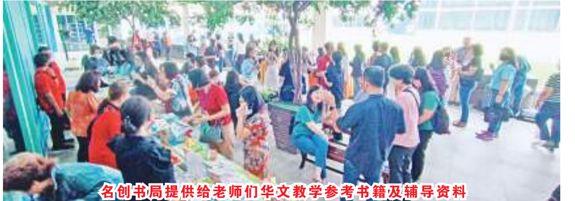
名创书局提供给老师们华文教学参考书籍及辅导资料