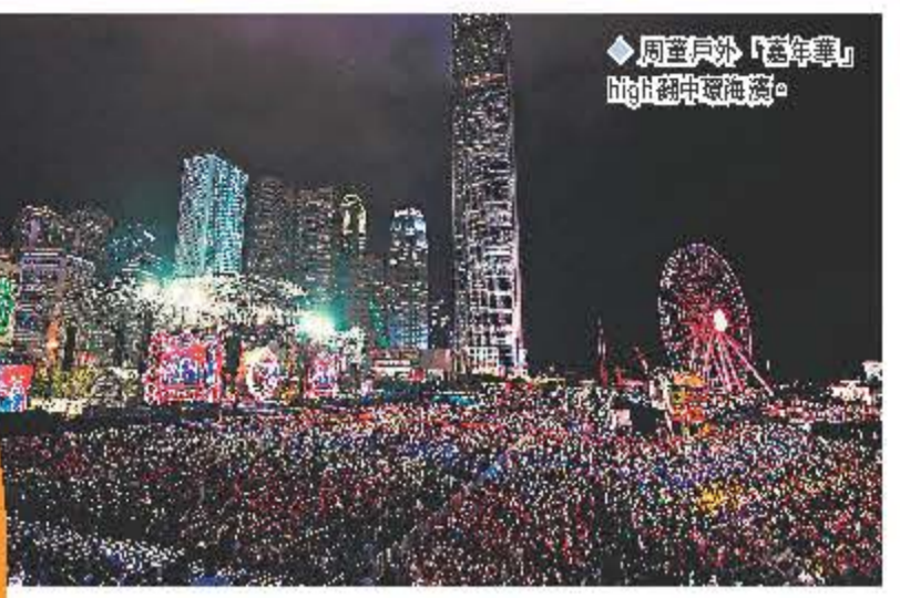
周董戶外「嘉年華」High翻中環海濱。