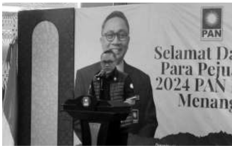
国民使命党主席祖基菲。

止，国民使命党仍未确定其政治态度，即通过印尼斗争民主党与团结建设党锚定对甘贾尔的支持，或者与大印尼行动党和民族复兴党共同支持普拉波沃。