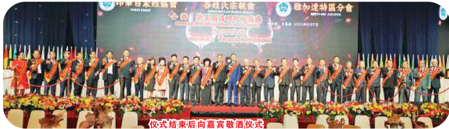
仪式结束后向嘉宾敬酒仪式

主礼嘉宾首先点亮了主祭台上的光明灯，各姓氏宗亲会主席随后点亮了各姓氏祖先牌位前的光明灯，寓意光明永远照亮着华夏子孙儿女，保