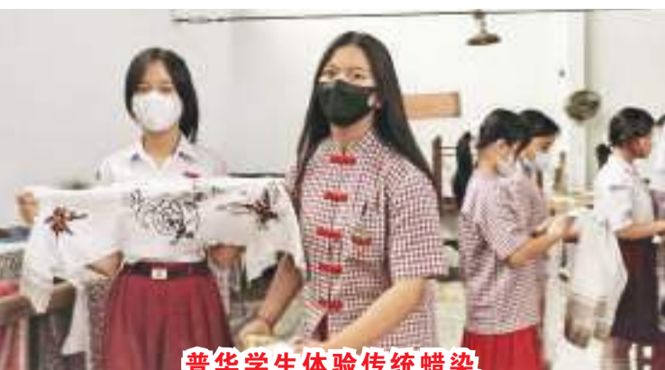
普华学生体验传统蜡染