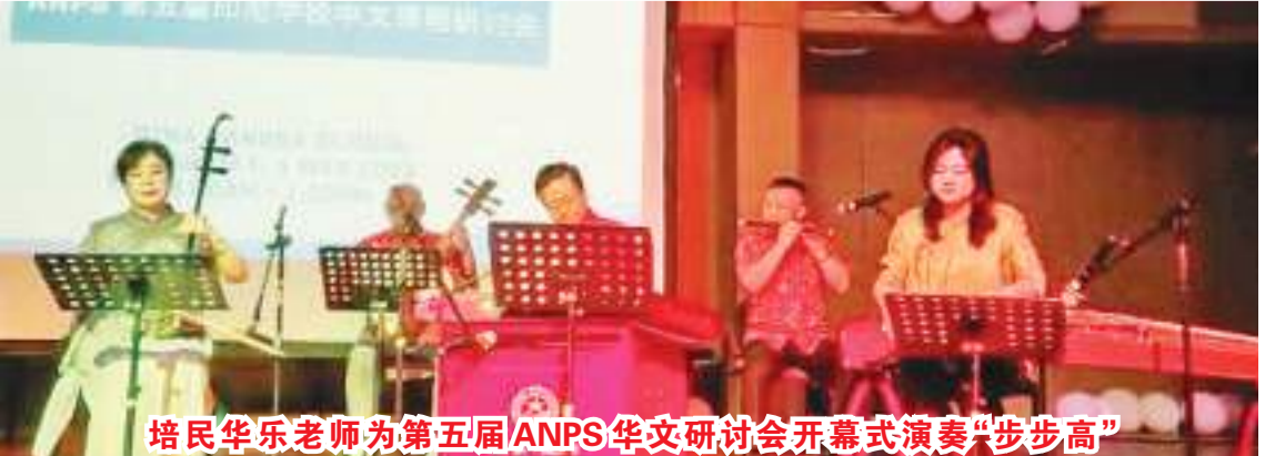
培民华乐老师为第五届ANPS华文研讨会开幕式演奏“步步高”