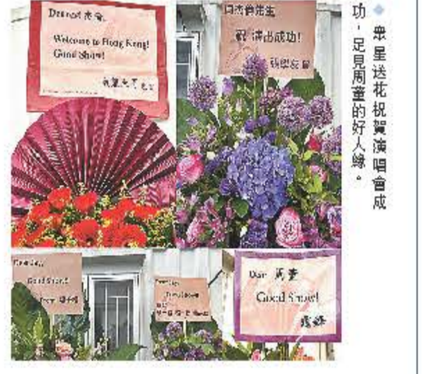
眾星送花祝賀演唱會成功,足見周董的好人緣。