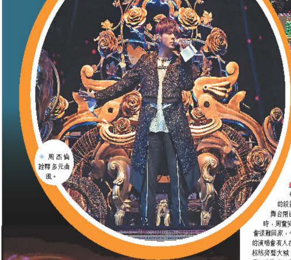
周杰倫詮釋多元曲風。

香港文匯報訊(記者 子棠)周杰倫(周董)睽違5年再度赴港,舉行的7場《嘉年華世界巡迴演唱會2023香港站》5日晚在中環海濱活動空間舉行首場,而7場演唱會將累積14萬名觀眾,成為該場地個人演唱會最多場次及最多觀眾的歌手。今次是周董首度在港的戶外場地開唱,由於演唱會一票難求,未能購票的粉絲就聚集在核心外圍,甚至有人不顧安全地攀欄、爬牆、騎馬等,只求窺看偶像的場內演出,險象環生,連同在海面遠觀的船上人士,海陸擠滿過萬未能進場的歌迷。