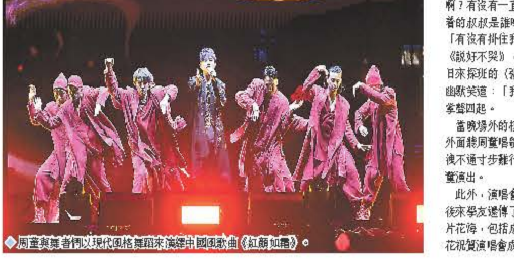
周董與舞者們以現代風格舞蹈來演繹中國國歌《紅顏如夢》。