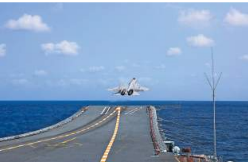
◆山東艦編隊參加了環台島戰備警巡和「聯合利劍」演習。圖為4月9日，殲-15艦載機從海軍山東艦起飛升空。資料圖片