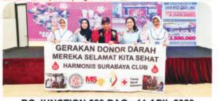
BG JUNCTION 523 BAG - 11 APRIL 2023 4月11日, 在BG Junction 购物中心, 523袋