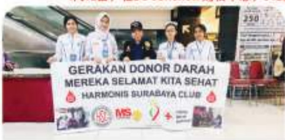
BG JUNCTION 518 BAG - 15 APRIL 2023 4月15日, 在BG Junction 购物中心, 518袋