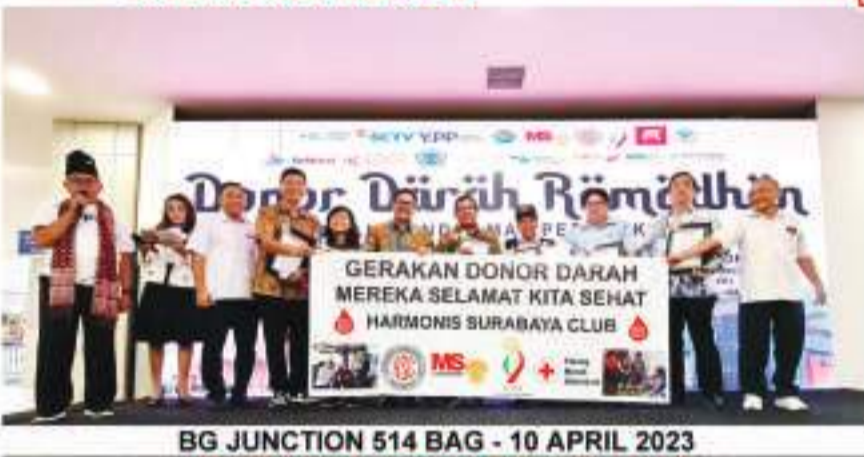
BG JUNCTION 514 BAG - 10 APRIL 2023 4月10日, 在BG Junction 购物中心, 514袋

Harmonis Surabaya Club Peduli Kemanusiaan 2023 年献血活动