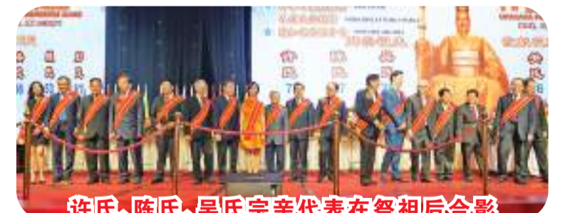
许氏、陈氏、吴氏宗亲代表在祭祖后合影