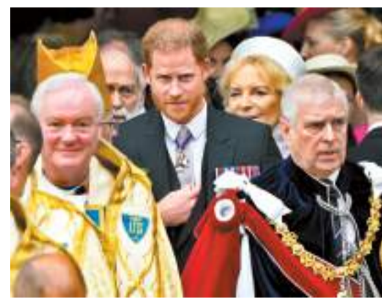
◆哈里(中)及安德魯(右)均有出席儀式。

參加儀式的一名普通賓客。」至於因性騷擾醜聞被剝奪王室頭銜和軍銜的安德魯王子，則與其他王室高級成員一樣身穿嘉德騎士長袍現身加冕儀式，亦有與子女出席前一晚的王室家族私人晚宴。查爾斯三世加冕儀式結束後乘坐黃金馬車回城期間，安德魯與哈里均未出席跟在馬車後方的王室成員行列。