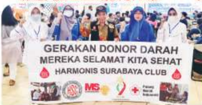
BG JUNCTION 645 BAG - 19 APRIL 2023 4月19日, 在BG Junction 购物中心, 645袋