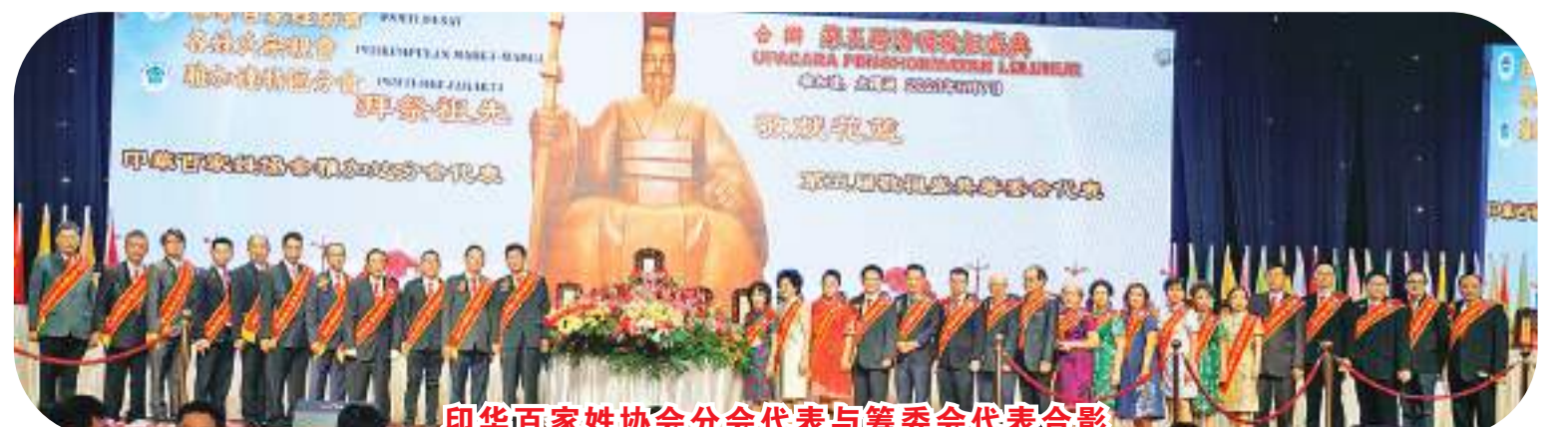
印华百家姓协会分会代表与筹委会代表合影