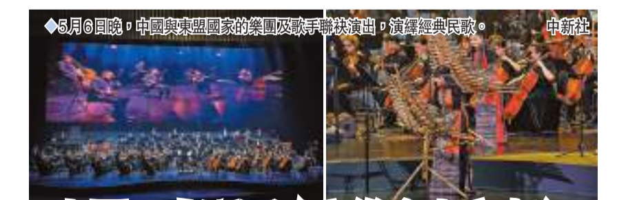
◆5月6日晚，中國與東盟國家的樂團及歌手聯袂演出，演繹經典民歌。

加強經貿等領域交流合作 三方同意重啟外長對話框架下的對話機制，加強經貿、農業、減貧、人文等領域交流合作，推進共建「一帶一路」合作，支持中巴經濟走廊向阿富汗延伸，促進三國和地區互聯互通，完善跨境貿易體系，增進三國經濟融合，實現可持續發展。