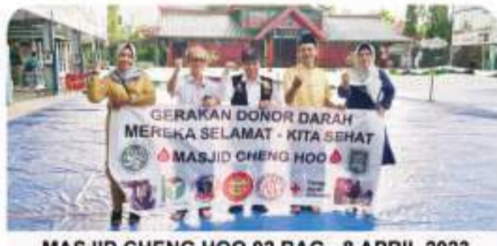
MASJID CHENG HOO 92 BAG - 8 APRIL 2023 4月8日, 在Cheng Hoo 清真寺, 92袋