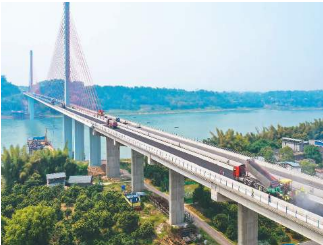
白沙长江大桥作为四川省泸州市重要的渡改桥项目，在建成通车后，将方便两岸三十万群众安全出行，助推当地乡村振兴。图为五月四日，工人在泸州市合江县白沙长江大桥上加紧沥青铺设。

后续，天舟五号货运飞船将在神舟十五号载人飞船撤离空间站组合体后，绕飞并对接于空间站节点舱前向端口。