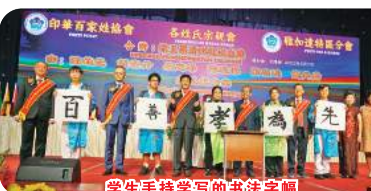
学生手持学写的书法字幅