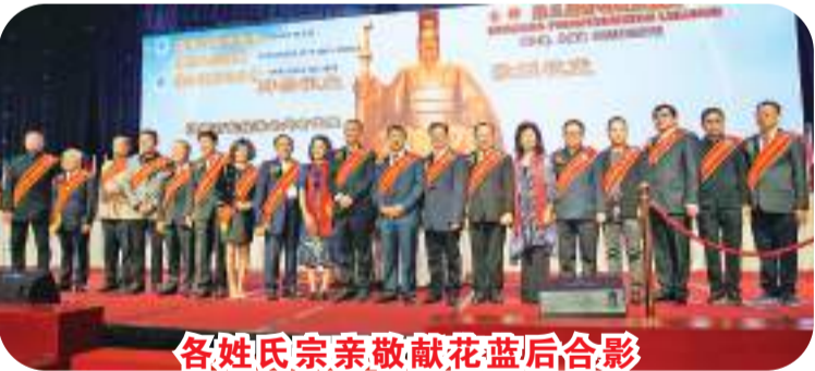
各姓氏宗亲敬献花篮后合影