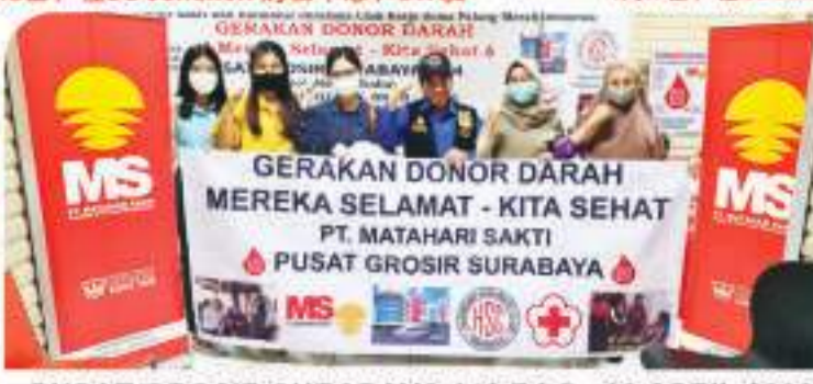
PUSAT GROSIR SURABAYA 143 BAG - 29 APRIL 2023 4月29日, 在Pusat Grosir Surabaya, 143袋