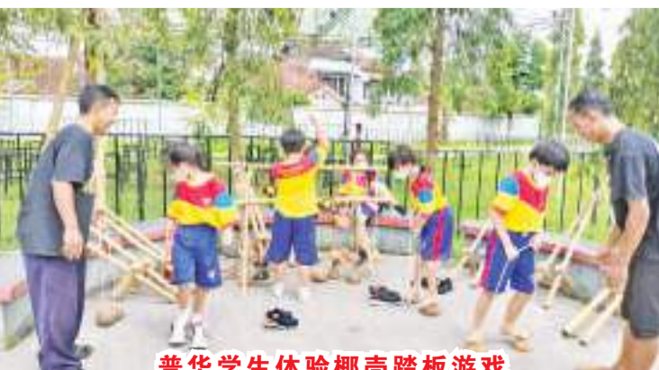
普华学生体验椰壳踏板游戏