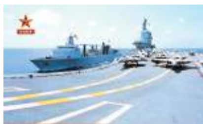
◆山東艦同步開展戰鬥值班、課題演練、飛行訓練。視頻截圖