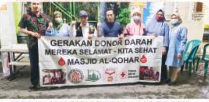
MASJID AL QOHAR 30 BAG - 9 APRIL 2023 4月9日, 在Al Qohar 清真寺, 30袋