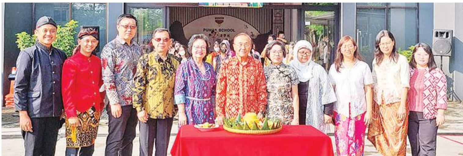
普华基金会及校长合影

【本报讯】4月30日，普华学校迎来了117岁生日。在一个多世纪的沧海桑田中，普华经历了萌芽、发展、壮大、沉沦、复兴直至今天，普华终于迎来了117岁的生日。普华最初成立于1906年，为普禾格多中华会馆学校；而普华三语学校于2006年4月30日正式结束了普华的旗帜，在普禾格多这片土地上重生，至今已有17个年头。自复校至今，普华三语学校一直坚持“有教无类”的教学理念，所以普华学校不只是坚持三语教育，更坚持多元文化的和谐发展。发展至今，普华已经成为自幼儿园至高中，拥有700多