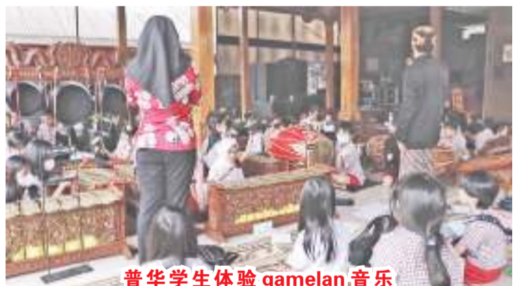
普华学生体验 gamelan 音乐