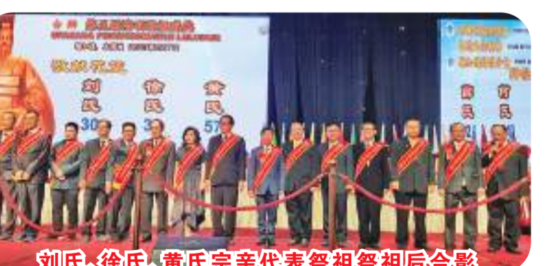
刘氏、徐氏、黄氏宗亲代表祭祖后合影