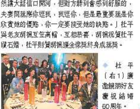
杜平(右1)廣邀親朋好友慶祝結婚60周年。

香港文匯報訊 今年是現年67歲的粵語片年代當紅小生、《歡樂今宵》元老級主持杜平與太太的60周年鑽石婚紀念,廣邀親朋好友到澳洲參加其慶祝派對,筵開23國超過200名賓客到場,多位藝人包括杜平的子女張光倫和翁虹、當年《歡樂今宵》拍檔修哥胡楓、蔡和平夫婦、森森、吳鳳珠、鄧英敏、梁碧玲,以及王祖藍及太太李亞男等飛赴當地道賀。 杜平與太太以「閃黑情侶裝」亮相,二人互餵蛋糕,甜蜜親吻。問及夫妻相處之道,杜平幽默地表示最重要是說一些美麗的謊言,他說:「雖然講大話信口開河,但對方聽到會感到舒服的,夫妻間就應你逗我,我逗你,但是最重要就是你欣賞她的優點,你一定要接受她的缺點。」杜平與老友胡楓互送高帽,互相恭賀,胡楓祝賀杜平鑽石婚,杜平則賀胡楓獲金像獎終身成就獎。