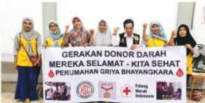
GRIYA BHAYANGKARA 90 BAG - 8 APRIL 2023 4月8日, 在Griya Bhayangkara, 90袋