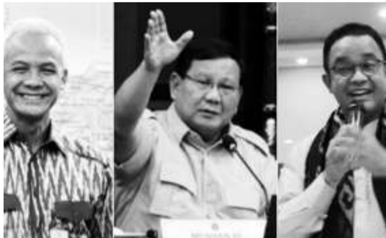
左起: 甘贾尔、普拉波沃和阿尼斯。

【本报讯】LSI 民调机构发布了有关2024年总统大选的最新调查结果，普拉波沃 (Prabowo Subianto) 的支持率名列前茅，其次是甘贾尔 (Ganjar Pranowo)，排名第三是阿尼斯 (Anis Baswedan)。