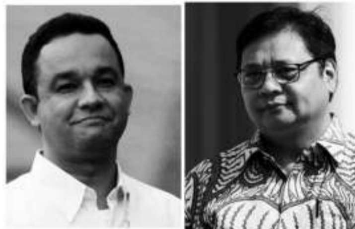
左起: 阿尼斯和艾朗卡。

【本报讯】团结变革联盟 (KPP) 总统候选人阿尼斯表示，正在斟酌联盟内的副总统候选人。阿尼斯的这番话是在回应与从业党主席艾朗卡进行组合的构思而传达的。