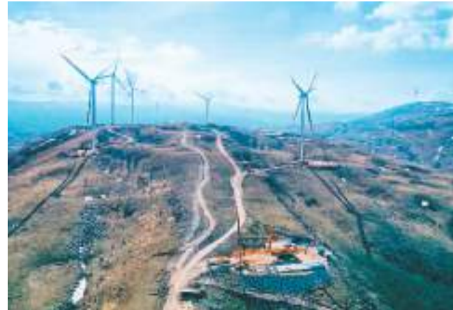
波黑伊沃维克风电场施工现场。

从波黑首都萨拉热窝西行，驱车约3小时就能到波黑与克罗地亚交界处的一片喀斯特丘陵地带。这里是