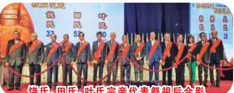
饶氏、田氏、叶氏宗亲代表祭祖后合影