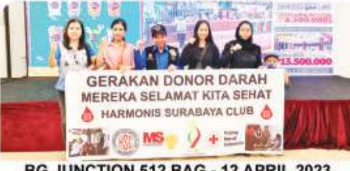
BG JUNCTION 512 BAG - 12 APRIL 2023 4月12日, 在BG Junction 购物中心, 512袋