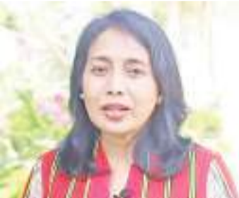
妇女赋权和儿童保护部 I Gusti Ayu Bintang Darmawati 部长祝贺普华 117 周年校庆

【本报讯】4月30日，普华学校迎来了117岁生日。在一个多世纪的沧海桑田中，普华经历了萌芽、发展、壮大、沉沦、复兴直至今天，普华终于迎来了117岁的生日。普华最初成立于1906年，为普禾格多中华会馆学校；而普华三语学校于2006年4月30日正式结束了普华的旗帜，在普禾格多这片土地上重生，至今已有17个年头。自复校至今，普华三语学校一直坚持“有教无类”的教学理念，所以普华学校不只是坚持三语教育，更坚持多元文化的和谐发展。发展至今，普华已经成为自幼儿园至高中，拥有700多