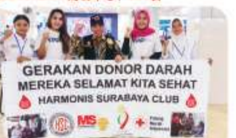
BG JUNCTION 500 BAG - 18 APRIL 2023 4月18日, 在BG Junction 购物中心, 500袋