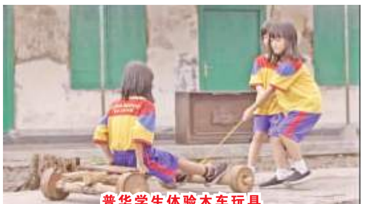
普华学生体验木车玩具