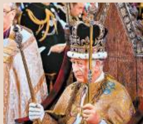
◆查爾斯三世獲授君主權杖，戴上聖愛德華皇冠。