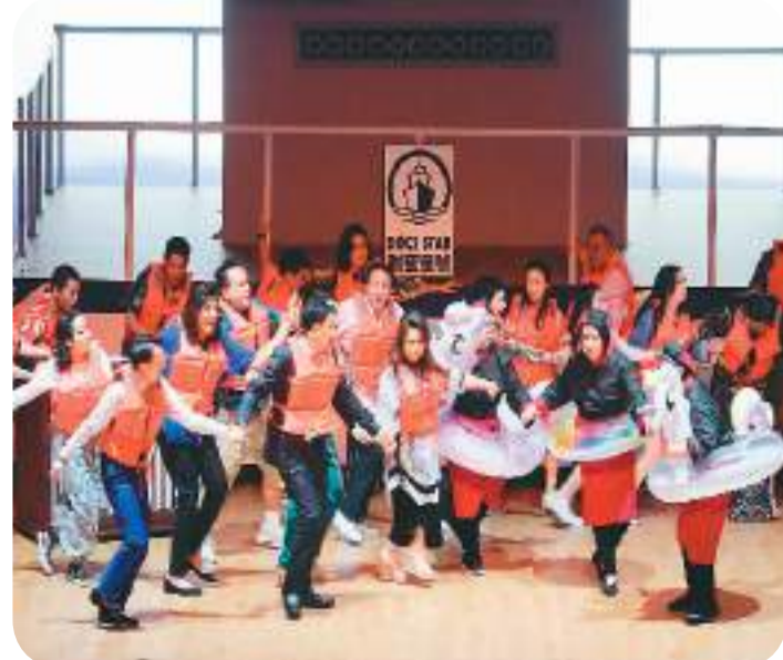
▲ 澳门土生土语话剧《砂煲罌罌嘉年华》剧照。

据介绍，本届澳门艺术节还结合本地文旅资源，推出凭来澳机票8折观演、赠送景点参观券和餐饮券等多项优惠措施，吸引更多游客来澳共赴文化艺术之约。澳门特区政府文化局局长梁惠敏表示，本届艺术节风格多元，精彩纷呈，力求开拓艺术鉴赏视野，让审美启迪日常生活。“今年5月，澳门艺术节诚邀各位一同感悟路上时光，发现最美风景。”梁惠敏说。