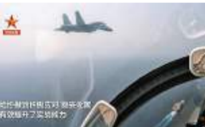
◆據央視消息，西太平洋戰備訓練中，外軍艦機輪番對山東艦偵察試探。視頻截圖