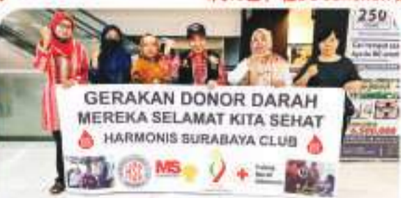
BG JUNCTION 517 BAG - 16 APRIL 2023 4月16日, 在BG Junction 购物中心, 517袋