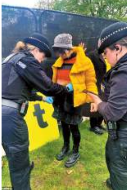
◆警員在典禮前攔截示威者隨身物品。網上圖片