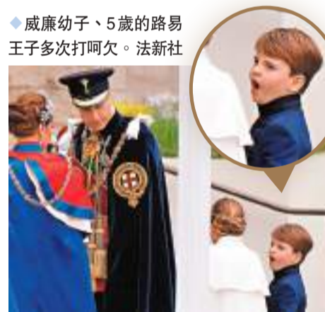
◆威廉幼子、5歲的路易王子多次打呵欠。

習近平和彭麗媛在賀電中指出，當前世界正經歷深刻複雜變化，國際社會面臨許多前所未有的挑戰。中英同為聯合國安理會常任理事國，應以長遠和戰略眼光，共同推動和平、發展、合作、共贏歷史潮流。中方願同英方一道努力，增進人民友好，擴大互利合作，深化人文交流，以穩定互惠的中英關係更好造福兩國和世界。