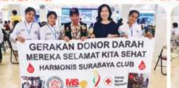
BG JUNCTION 505 BAG - 17 APRIL 2023 4月17日, 在BG Junction 购物中心, 505袋