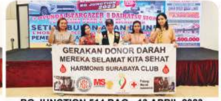
BG JUNCTION 514 BAG - 13 APRIL 2023 4月13日, 在BG Junction 购物中心, 514袋