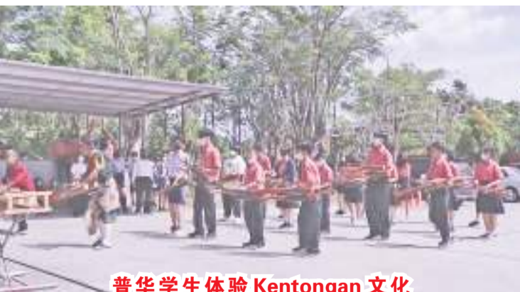
普华学生体验 Kentongan 文化