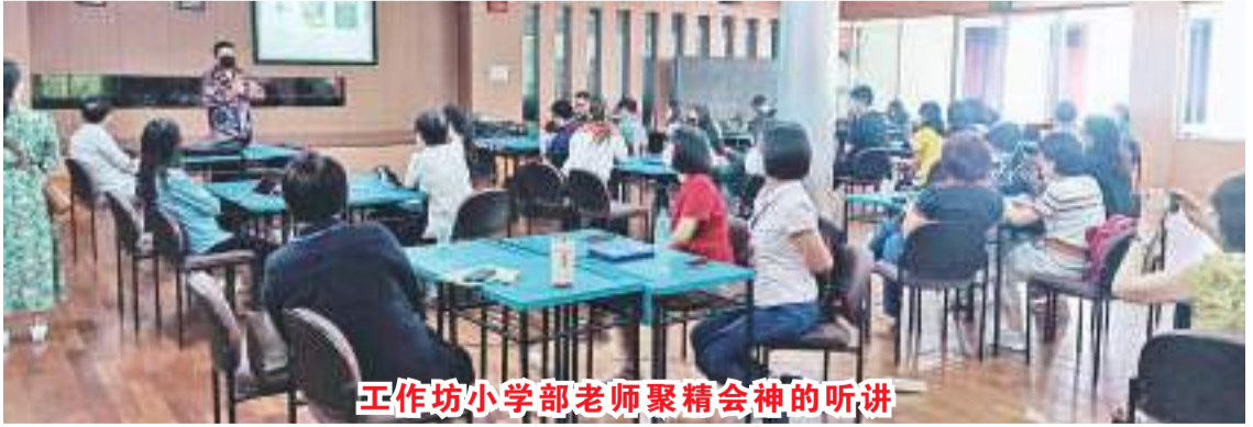
工作坊小学部老师聚精会神的听讲

总的来说，此次研讨会取得了巨大的成功，并为印度尼西亚的华文教师和教育工作者带来了许多好处。ANPS 和培民学校希望在未来能够举办更多类似的活动，以持续提高印度尼西亚华文教育的质量。