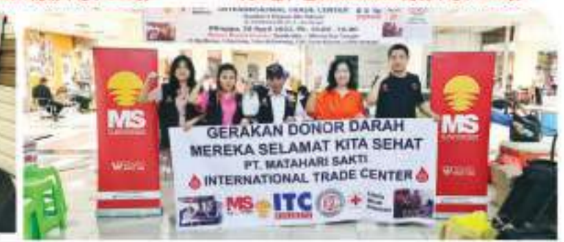
INTERNASIONAL TRADE CENTER 117 BAG - 30 APRIL 2023 4月30日, 在Internasional Trade Center (ITC), 117袋