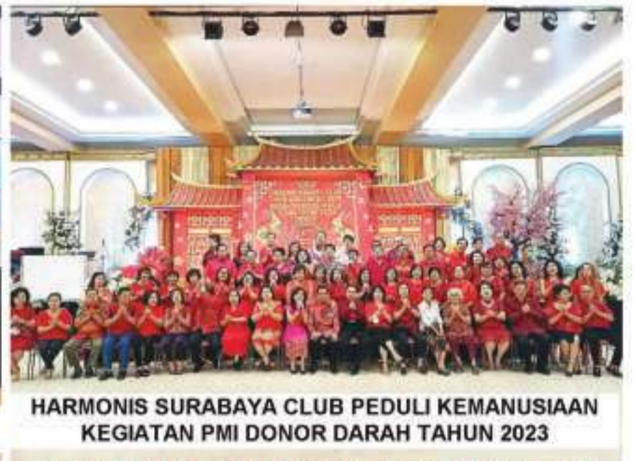
HARMONIS SURABAYA CLUB PEDULI KEMANUSIAAN KEGIATAN PMI DONOR DARAH TAHUN 2023