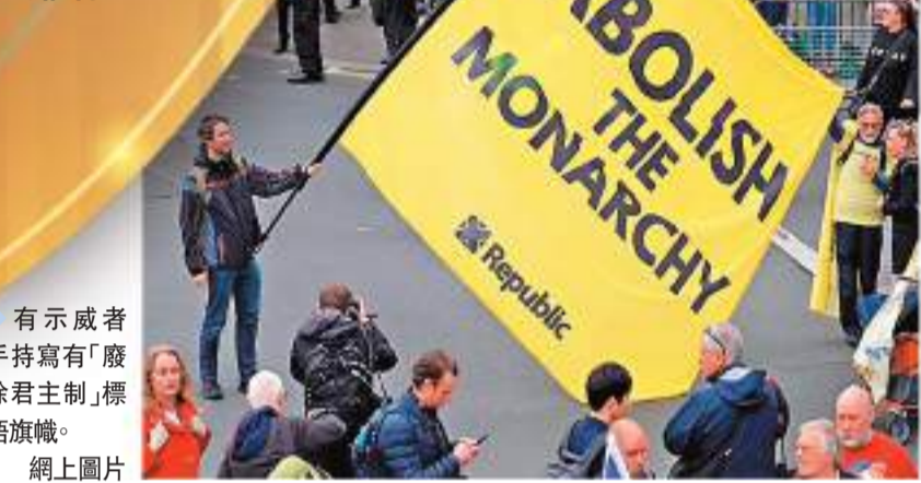
有示威者手持寫有「廢除君主制」標語旗幟。

香港文匯報訊 英王查爾斯三世6日舉行加冕儀式，成為英國歷來最年長登基的君主。在加冕儀式開始前，倫敦多名主張共和制的抗議人士在街頭示威時被警方拘捕。有示威者透露，警方疑似以部分示威者手持「大聲公」（擴音器）等違規設備為由拘捕示威者。人權組織批評英國警方有意針對反對君主制人士，剝奪他們自由表達訴求的權利。