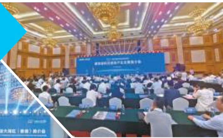
5月31日，湖南省科技創新產業發展推介會在深圳舉行。

數據顯示，湖南省外遊客約70%來自粵港澳地區。當前，「奇秀山水」「經典紅色」「都市休閒」「歷史文化」「農耕文化」這五張湖南旅遊名片相映成畫，廣為人知。湖南有遍布全境的山水絕色，可以到張家界觀奇山秀水，到真山賞色艷丹朱，到洞庭湖攬湖光美景，到橘子洲看湘江北去。湖南有豐富厚重的紅色資源，走出了毛澤東、劉少奇、彭德懷、賀龍、羅榮桓等老一輩革命家。湖南有創新多維的娛樂業態，這裏有「節假日全國人民來度假」的網紅長沙。湖南有傳承悠久的歷史文脈，從被稱為「華夏第一陵」的炎帝陵，到被譽為「神州第一陵」的舜帝陵；從獨秀天下的南嶽衡山，到聞名遐邇的岳陽樓、屈子祠、馬王堆遺址公園，無