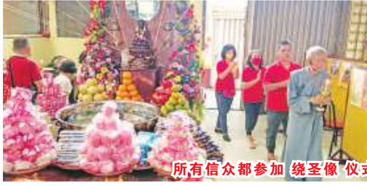
所有信众都参加绕圣像仪式，祈祷和诵经，手持蜡烛和合掌