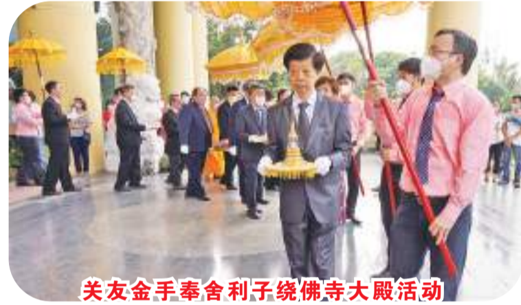
关友金手奉舍利子绕佛寺大殿活动