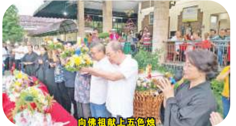
向佛祖献上五色烛

【本报讯】2023年5月28日(周六)下午4时,座落于棉兰-民礼13.8公里路星光村菩提乐园敬老院,恭请民礼佛教寺住持古祺