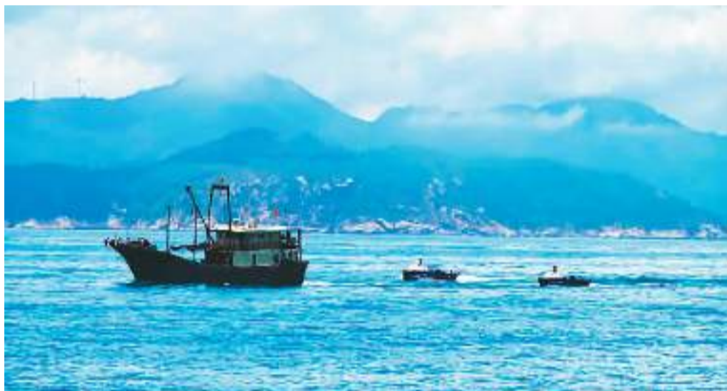
左图：海洋考古受海洋气象、水文、地质等环境因素影响。水下文物的探测、提取工作难度大，不可控因素复杂多变。

南方海洋实验室海洋考古创新团队利用科考船（前）与无人艇（后）同时搭载多种海洋探测设备如侧扫声呐、多波束声呐、浅地层剖面声呐等探测设备进行古遗址勘测。