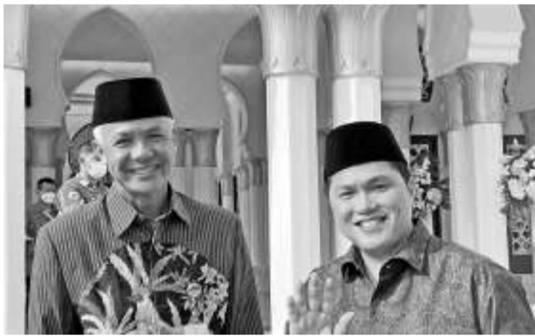
左二起：哈斯托与穆海敏等会谈。

【本报讯】6月4日，在回答媒体提出的关于印尼斗争民主党何时回访国民使命党的问题时，印尼斗争民主党秘书长哈斯托表示，国民使命党向埃里克为甘贾尔总统候选人的副座人选。然而，哈斯托没有透露在印尼斗争民主党对国民使命党的回访问时，是否会讨论埃里克