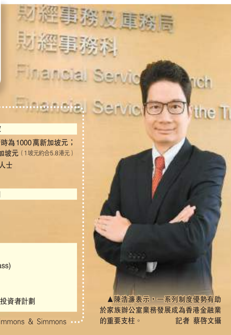
▲陳浩濂表示，一系列制度優勢有助於家族辦公室業務發展成為香港金融業的重要支柱。

在特區政府非常積極且全方位地吸納內地及海外家族辦公室來港之際，財經事務及庫務局副局長陳浩濂日前接受本報專訪時表示，香港擁有一系列制度優勢，家族辦公室業務將成為香港金融業的重要支柱。他強調，自己不同意香港在吸納家族辦公室業務方面過度側重於內地的觀點；而且，與新加坡相比，香港對家族辦公室的稅務減免政策等較為優勝。香港商報記者 鄭偉軒