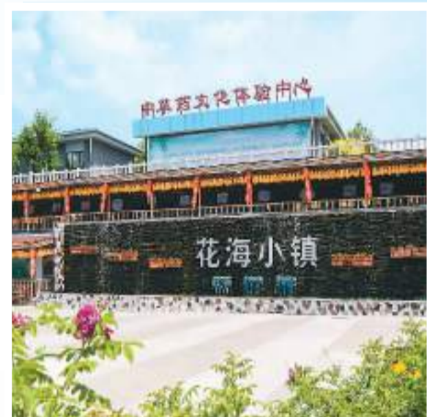
▲热河中药花海小镇广场。