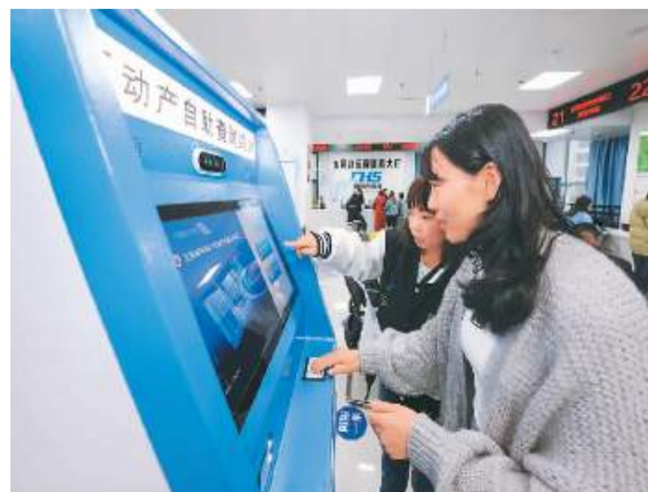
市民在贵州省铜仁市玉屏侗族自治县的“智慧政务”自助终端办理业务。