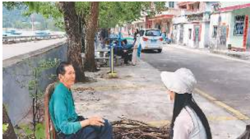
下图：文献搜集整理及海洋沉积学数字模拟计算，是“海洋古沉船”技术整合与研发“重要的前期工作。图为2023年4月，南方海洋实验室海洋考古创新团队前往广东江门台山沿海，了解当地渔业历史和海洋人文故事。

以我国粤港澳大湾区为例，这里既面临全球化对传统海洋文化特色产生的冲击。所以，亟待增强对粤港澳大湾区及南海区域“海丝”文化遗产的系统调查能力和价值研究能力，尤其应倡导以理工多学科交叉和融合的研究思路，以协同创新为导向，综合海洋遗址探测技术、科技考古和海洋文化遗产价值研究，研发创建专项资源数据库与“一张图”可视化智慧管理平台。