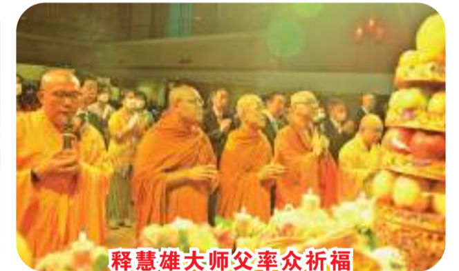
释慧雄大师父率众祈福