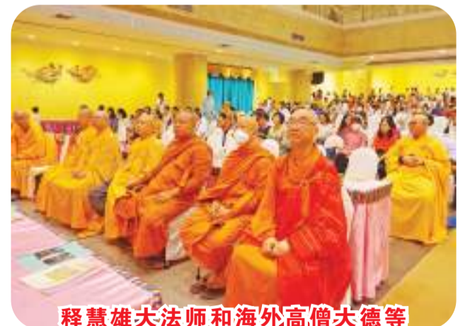
释慧雄大法师和海外高僧大德等