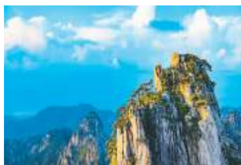
安徽黄山顶峰云蒸霞蔚。

茂名市副市长高雪山表示，今后茂名将以气象为特色，以文旅为载体，以产业为抓手，开展气候资源可持续开发利用研究，挖掘气候生态产品价值；开展茂名“气象旅游+”能力建设，打造特色旅游岛样板。