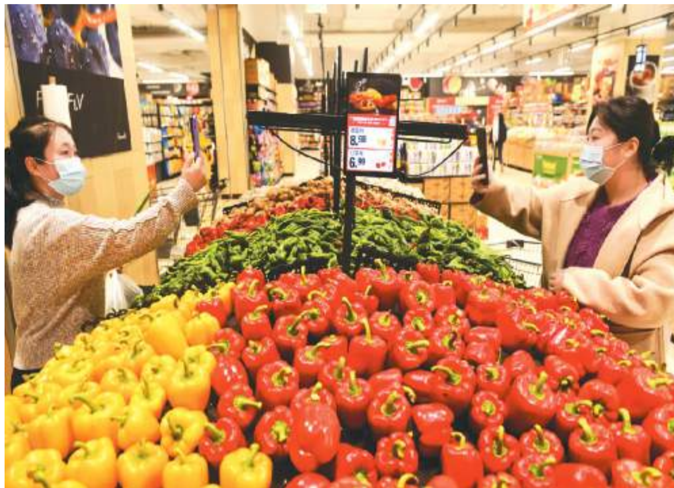
在安徽省阜阳市颍东区永辉超市世纪金源店蔬菜专区，市民通过手机扫码了解购买蔬菜的详细信息。

通过“物理+技术+运营”三位一体的图书防伪溯源体系，为出版机构的每一本图书赋予唯一的身份信息；采用区块链、二维码、缩微图文、揭起留底等多重防伪技术，为地区特色茶叶品牌提供保护；基于“一物一码”技术，为保健品企业的多品类商品加贴到开封式防伪标签，搭建成熟的数字化防伪平台……这些防伪溯源技术方案，有效融合了先进的信息防伪技术和物理防伪技术，在防伪力度、查验便捷性和稳定性等方面表现突出。近日，中国防伪行业协会发布“防伪溯源保护品牌十大优秀案例”。数字技术，已在防伪行业深度运用。