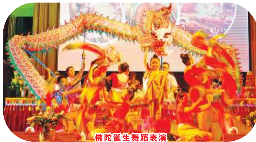
佛陀诞生舞蹈表演