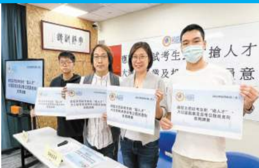
青年團體促請政府續以「大灣區青年就業計劃」培養兩地專才。

青年新世界歡迎特區政府宣布放寬大學生投考公務員要求，有關改革有助政府更早吸納人才，同時讓青年大學生對未來事業發展有更好規劃。由於近三成受訪文憑試考生有意將來畢業後投考公務員，團體呼籲社會應及早為青年提供生涯規劃，包括擴大「專上學生暑期實習計劃」、「公務員職系實習計劃」、「警隊隊長計劃（PMP）」、「香港特區政府駐內地辦事處暑期實習計劃」等公務員職系實習計劃，以配合提早招募改革。