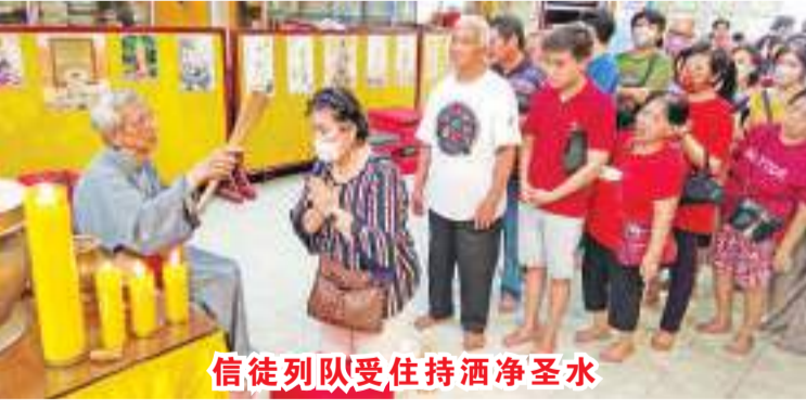
信徒排队受住持洒净圣水