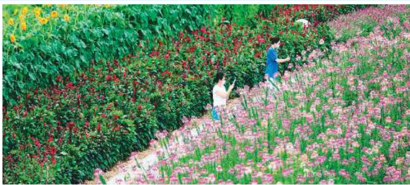
示园休闲游玩。游客在河北省滦平县热河中药花海小镇展