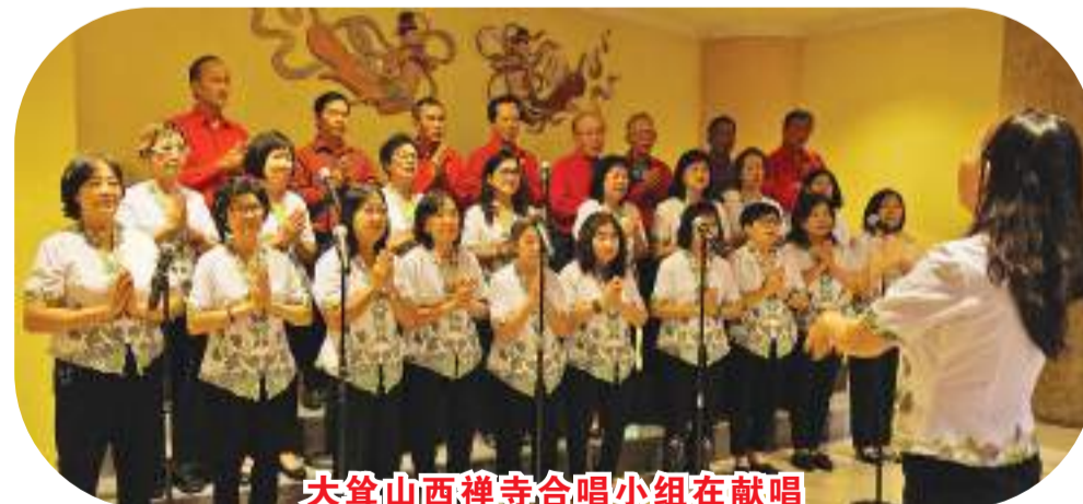
大丛山西禅寺合唱小组在献唱