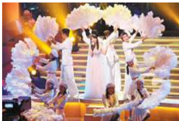
陳美齡3日晚參與《萬眾同心公益金》演出。