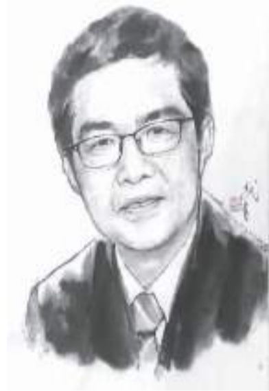
欧阳明高肖像。张武昌绘

电、光伏、煤电、水电的能源基地，适宜通过建设电化学储能电站，配合特高压输电，将电送到东部沿海经济发达地区。东南部、中东部和南部，火电厂密集，适宜抽水蓄能，配合高压输电网进行输送。东部人口密集地区，适宜分布式光伏、低压配电网配合“车网互动”来储能和发电。