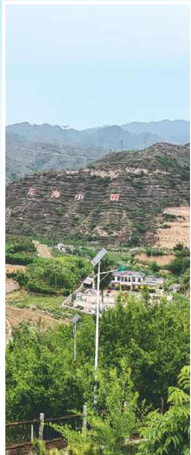
▲中药材种植基地景观。