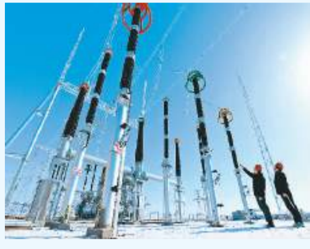
▲江西省赣州市会昌县庄口镇的光伏发电项目。 ▲甘肃省张掖市民乐县工业园区丝路网能绿色能源共享储能电站项目。