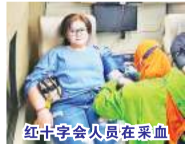
红十字会人员在采血

献血活动以弥补泗水红十字会血浆库存的不足,前来报名者共有110名,合格者85名,不合格者为25名。