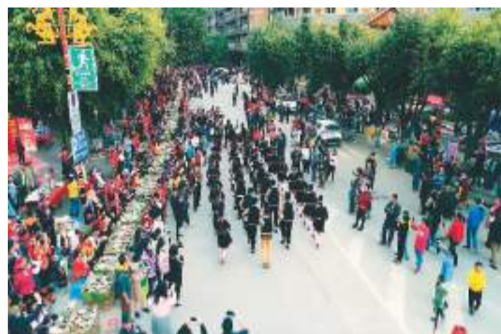
绿春一年一度的“十月年”长街宴。