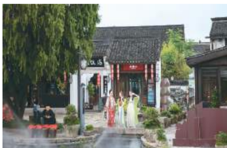
游客在绍兴越城区体会宋韵服饰之美。

将中国传统文化与时代发展相结合，形成符合当代需求与审美的“国潮”新风尚，已成为许多地方发展文旅产业的重要举措之一。