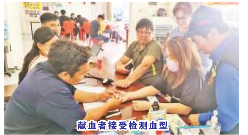
献血者接受检测血型