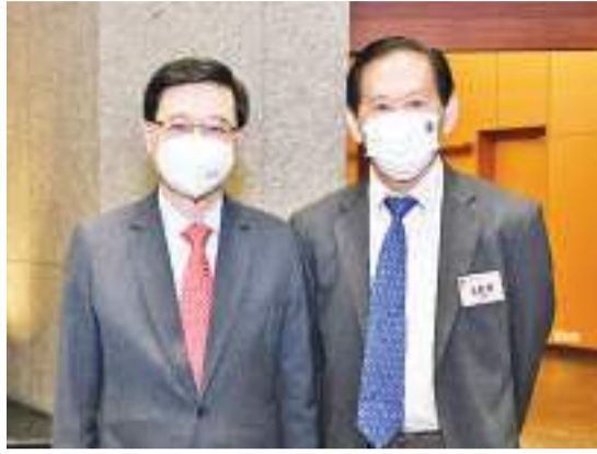
2022年9月9日,在香港江苏社团总会第四届就职典礼上,香港特别行政区行政长官李家超接见香港金轮集团主席王钦贤

因此,金轮集团除在港发展原有业务之外,随后在江苏省的南京、扬州、无锡、苏州,湖南省的长沙和株洲等地发展成一家综合型商业及住宅地产开发企业及运营商。近年,集团重点开发在江苏省及湖南省临近交通枢纽的地产项目,也从南京走向全国布局,进一步拓展轨道交通连锁商业,同时业务也扩展到印尼、新加坡、台湾等国家和地