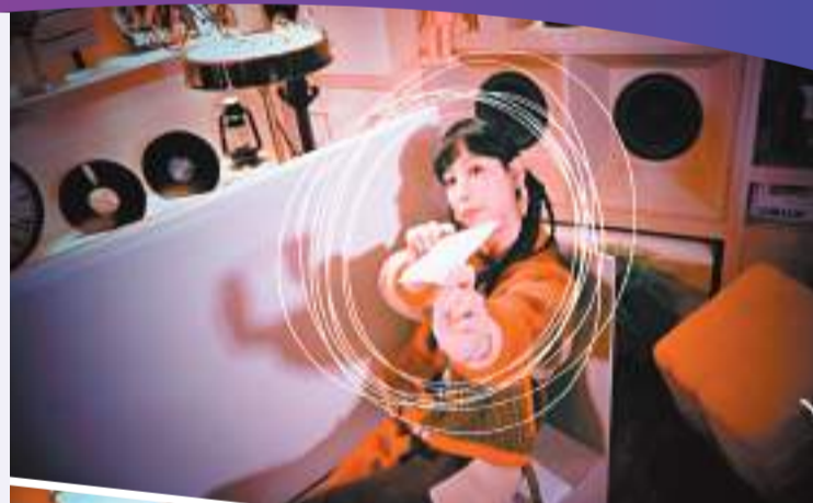
炎明熹會讀出讀者來信。