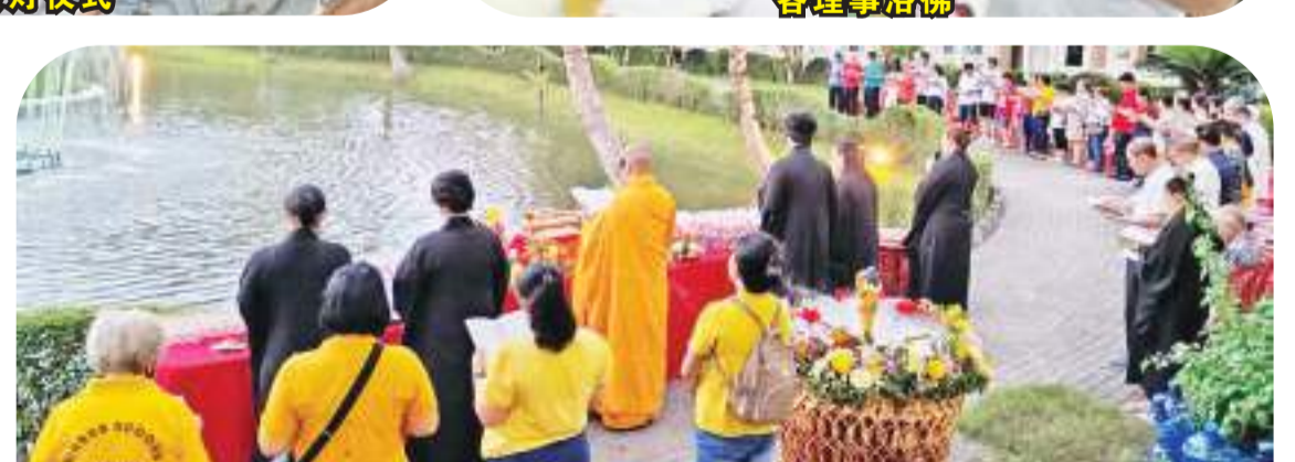
菩提乐园佛诞仪式现场