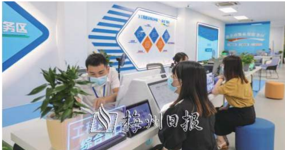
市政務服務中心企業服務廳近日啓用，極大方便企業辦事，實現營商環境大優化。

在推動落實上，我市大力推行一線工作法，建立“目標管理、責任落實、工作推進、考核獎懲”全流程閉環管理制度，倒逼領導幹部在位有為。“為營造親商愛商氛圍，市工商聯主動做到由管理思維向服務思