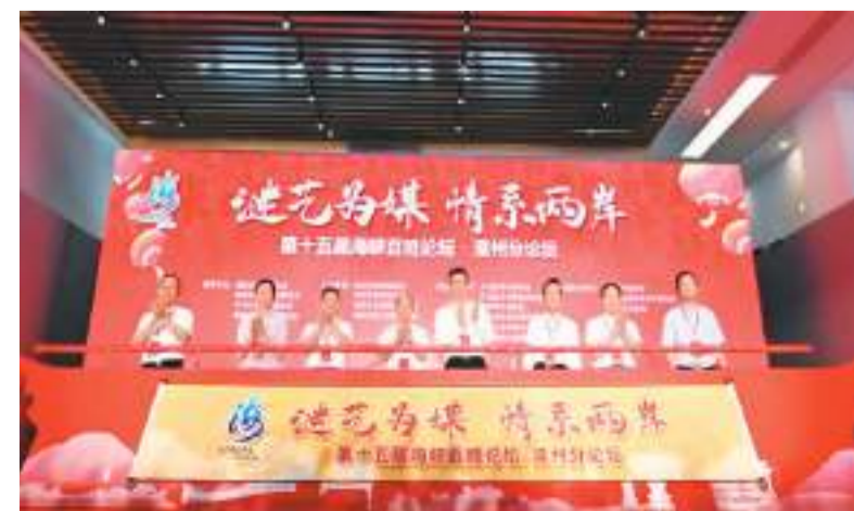
启动仪式现场。第十五届海峡百姓论坛·漳州分论坛

启动仪式后，两岸专家学者在灯谜文化艺术论坛上作主旨发言，从不同的角度追溯两岸姓氏源流，交流灯谜文化，共话两岸情谊。