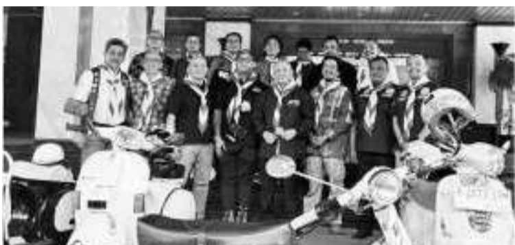
合作开办电动摩托车改装车间 6月5日,合作社和中小业部将与中小微企业携手合作,开办电动摩托车改装车间。

在佐科维政府期间建造很多的基础设施中得以体现出来,因为有了基础设施,我国的经济状况也变得更快增长,同时债务也用于教育和医疗设施的需要,以支持人力资源的素质发展。 值得一提的是,第10任和第12任副总统卡拉在5月20日曾提到,佐科维政府每年从国家预算案拨出1000万亿盾用于偿还债务,而且说这是自印尼独立以来最高的偿债额。 因此,财政部通过尤斯蒂努斯发言,毫不隐瞒地解释了佐科维总统期间的债务事实,但若相比于社区所得到的好处来说,债务总数实在微不足道。(Sm)