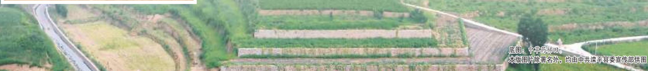
底图：中拿药梯田。本版图片除署名外，均由中共滦平县委宣传部供图