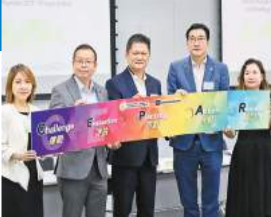
課程透過獨有的CEPAR™ 5步方法指導原則，培訓學員成為具資格證明的認可ESG策劃師。

國際可持續發展協進會（ICSD）創會主席葉榮鏗博士指出，現時市面上的課程多數傾向從投資分析角度出發，而非在工作間實際應用。為了將ESG教育普及化及專業化，解決企業面對的環境社會管理難題，ICSD策劃