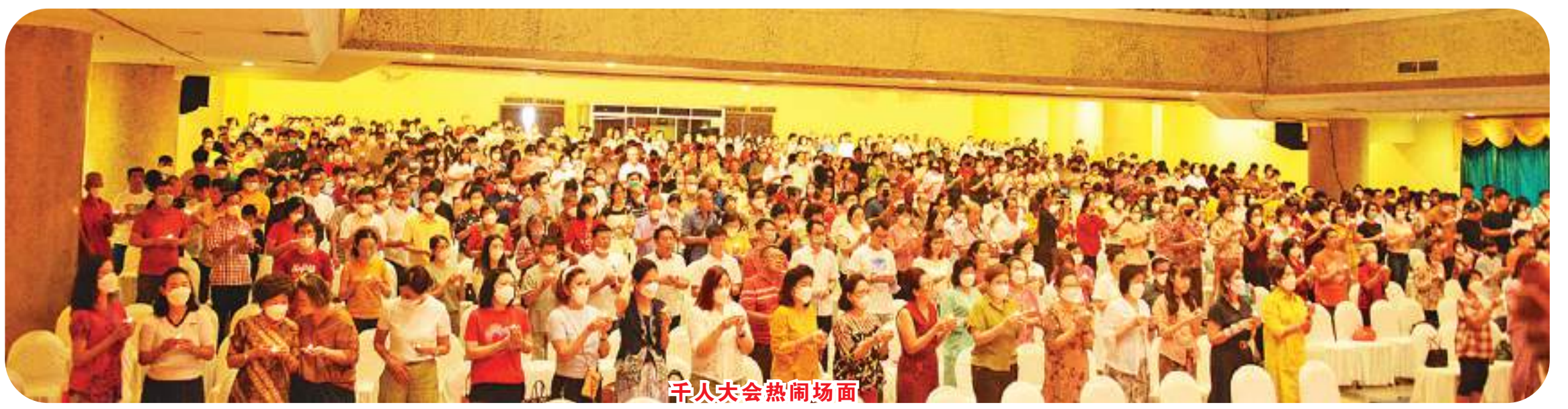
千人大会热闹场面