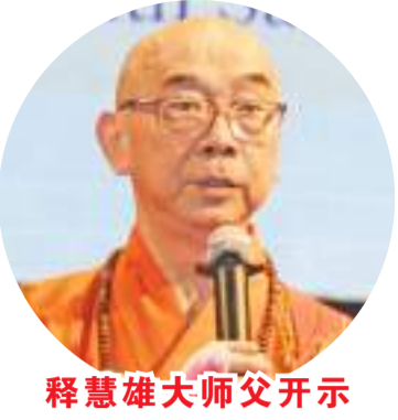
释慧雄大师父开示

【本报讯】2023年6月4日上午,印尼佛教中心协会(Indonesia Buddhist Center Association),在雅加达大丛山西禅寺“通过思维提高卫塞慈光,使人类得庄严成就圆满人生”为主题,隆重举行全球卫塞节庆祝大会。