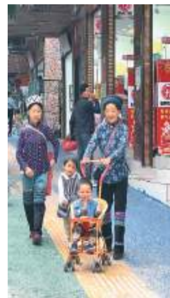
绿春街头一景。

她们神色从容而惬意，有的上点年纪的，蹲坐在学校对面的石梯上，等着孩子们下课；有的年轻一点的，围坐在街心花园里，刷着手机，笑着聊着。在这些自在、快乐