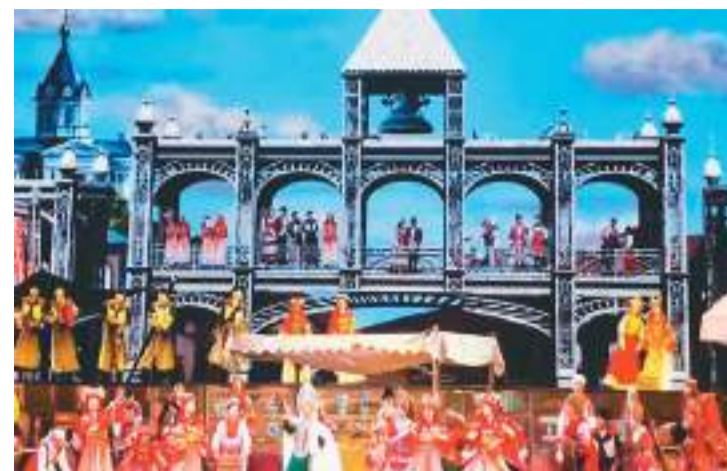
《天下茶道》舞台剧演出剧照。