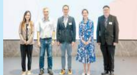
海洋公園主席龐建貽（中）盼學生能啟發創新的保育行動。

【香港商報訊】記者唐信恒報導：今天是「世界環境日」，海洋公園與香港創新基金早前合辦首屆「香港教育領袖高峰會2023」，吸引了近200名中學、小學、幼稚園的校長與教育機構代表出席，並就創科、糧食安全、生涯規劃等方面的保育及教育議題進行交流及討論。海洋公園同時宣布成立「海洋公園保育聯盟」，聯繫全港學校、兒童及青少年，加強培養學生對自然生態的興趣。