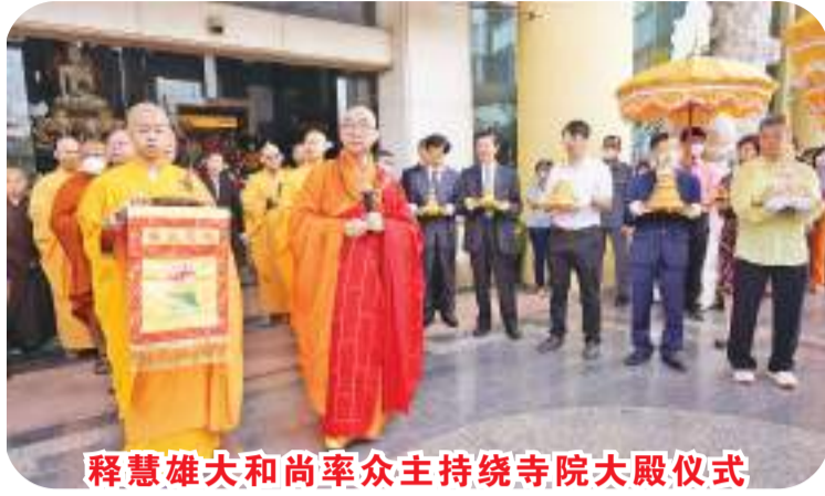
释慧雄大和尚率众主持绕寺院大殿仪式