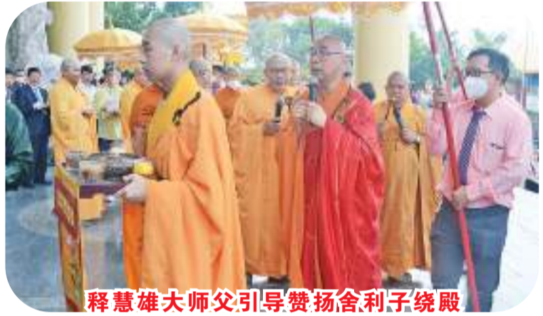
释慧雄大师父引导赞扬舍利子绕殿