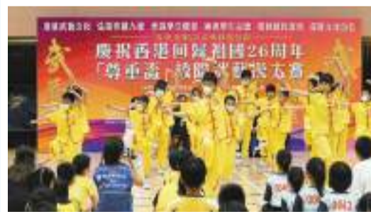
學生代表進行武藝操表演。

【香港商報訊】記者唐信恒報導：馮燊均國學基金會主辦、中國武術國際學院承辦的「五學並舉」之武藝校園計劃慶祝香港回歸祖國26周年「尊重盃」校際武藝操大賽，昨日舉行開幕儀式。基金會表示，希望透過活動提供互相尊重的成長空間，並祝願參賽者透過武藝活動重新裝備自己，未來光明遠大、德業日新。