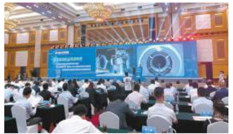
在湖南省科技創新產業發展推介會上，由中國航發湖南動力機械研究所牽頭建設的中小型航空發動機機冰風洞裝置被推介。