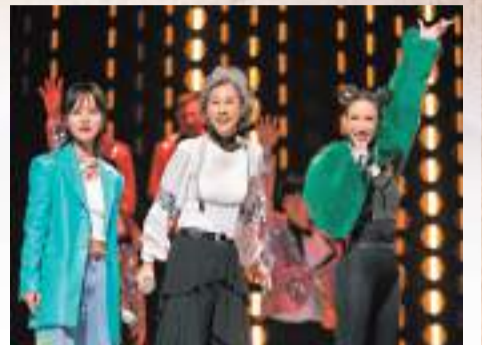
◆去年，李玟與葉蒨文、周筆暢在《聲生不息》上表演。