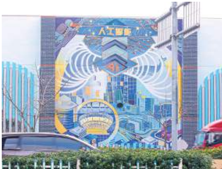
A graffiti painting about artificial intelligence in Dachang Town in Baoshan District.

typically used by workers at the old factory.