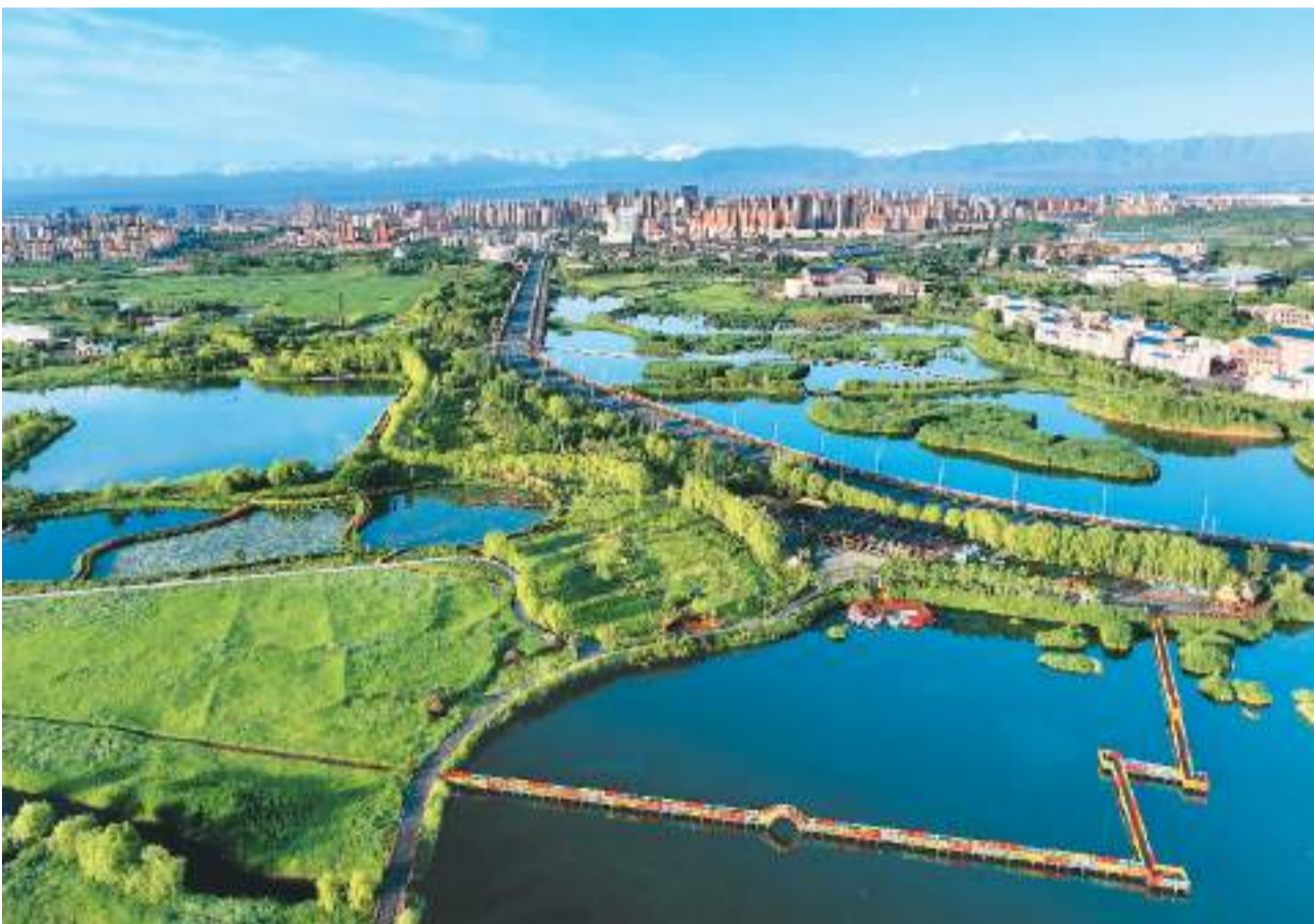
甘肃省张掖市近年通过水资源保护、水环境治理、连通水系和绿化美化等方式，持续打造宜居、宜业、宜游环境，促进人与自然和谐共融。图为近日拍摄的张掖国家湿地公园，碧水蓝天，景色如画。

本次研讨会由中国社会科学院主办。会议设“重振全球发展进程”“建设人与自然生命共同体”“深化文明交流互鉴”“践行真正多边主义”“平行情论坛”，以及减贫与落实联合国可持续发展议程专题研讨会、治国理政经验交流专题研讨会。来自国外政界、国际组织、社会科学领域知名专家学者以及中外智库、媒体界代表共200余人与会。