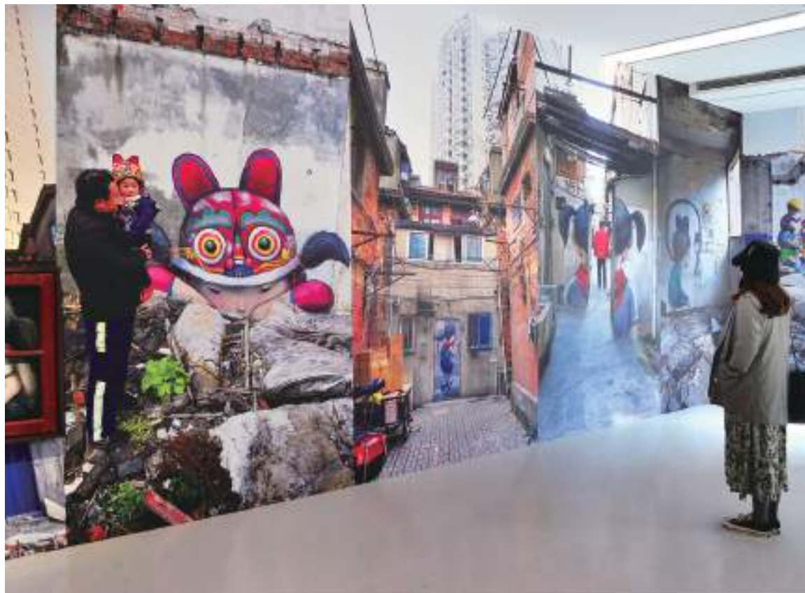
A painting from French artist Julien “Seth” Malland depicts the traditional lifestyle of Shanghai lane communities.