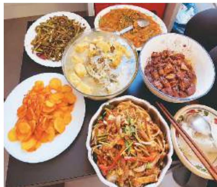
作者留学时经常和其他中国留学生一起做饭、聚餐。

平时晚上回家，我就用这“熟油辣子”加上酱油、醋、葱、蒜给自己做一份简单又美味的红油素面。如果时间充裕，我还会尝试红油拌鸡丝、拌干层肚。在家做饭经济实惠，用几欧元就可