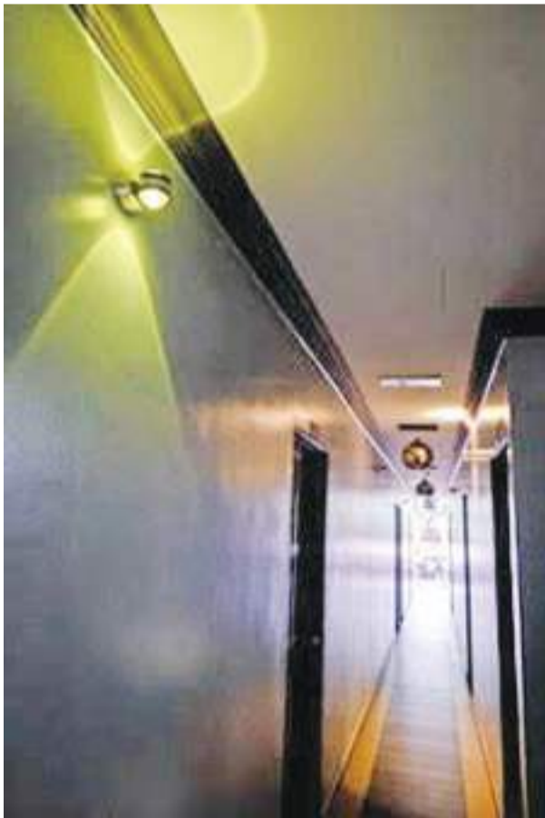
马来西亚柔佛的拉庆是一个南来北往的交通转车站,去年底因游适耕庄,回程时停宿拉庆一晚,在阴暗的小酒店里近身感受了拉庆,还有屋外那场滂沱的大雨...