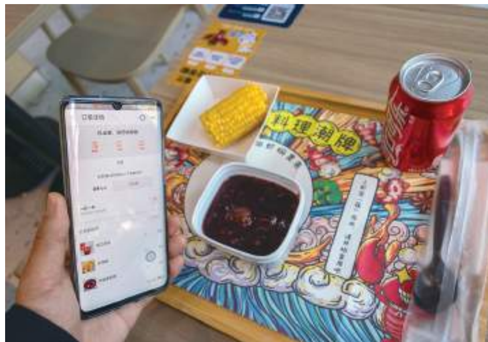
It may be convenient to scan a QR code to place an order, but is convenience worth the risk? — IC

Earlier this year, the Shanghai Consumers Council undertook a secret investigation of 29 shops in the city. It found that most milk tea outlets, like A Little Tea, collected personal