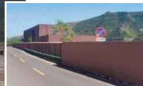
The walls prevent passers-by from seeing the Hukou Waterfall of Yellow River.

According to a commentary by Xinhua.com, the practice of