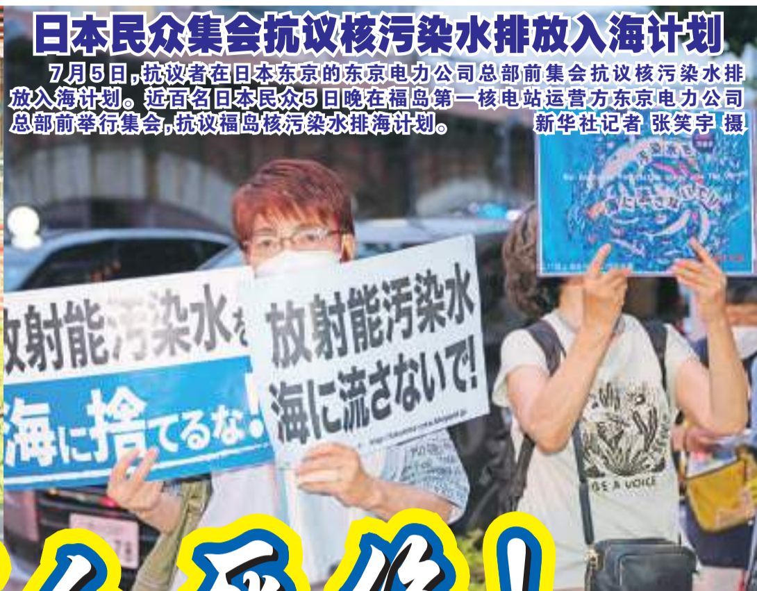
日本民众集会抗议核污染水排放入海计划 7月5日，抗议者在日本东京的东京电力公司总部前集会抗议核污染水排放入海计划。近百名日本民众5日晚在福岛第一核电站运营方东京电力公司总部前举行集会，抗议福岛核污染水排海计划。