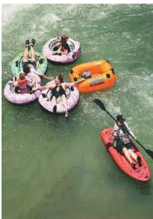
美国南部多地近日接连刷新高温纪录。图为近日，在美国得克萨斯州新布朗费尔斯，人们在河中消暑。