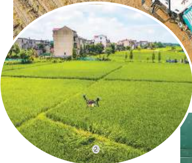
图②：江西省樟树市刘公庙镇黄溪村，“飞手”正在操作植保无人机给水稻喷施肥料。