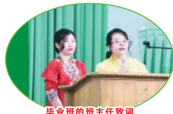
毕业班的班主任致词