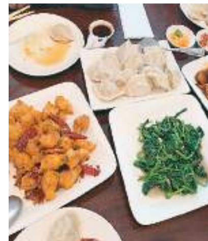
作者在旧金山吃到的地道中餐。

（作者系复旦大学中国语言文学系博士研究生，公派留学至美国密歇根大学安娜堡分校联合培养）