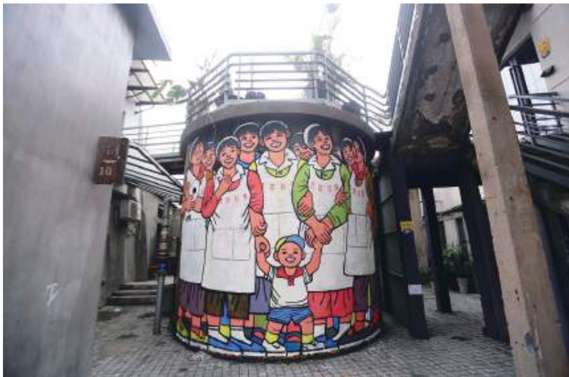
A popular graffiti painting about giggling textile ladies at the M50 art hub

In the downtown Jing'an District, Malaysian graffiti artist Kenji Chai's mural entitled "Numen of the Spiritual Homeland" portrays a woman wearing a traditional Chinese qipao dress.