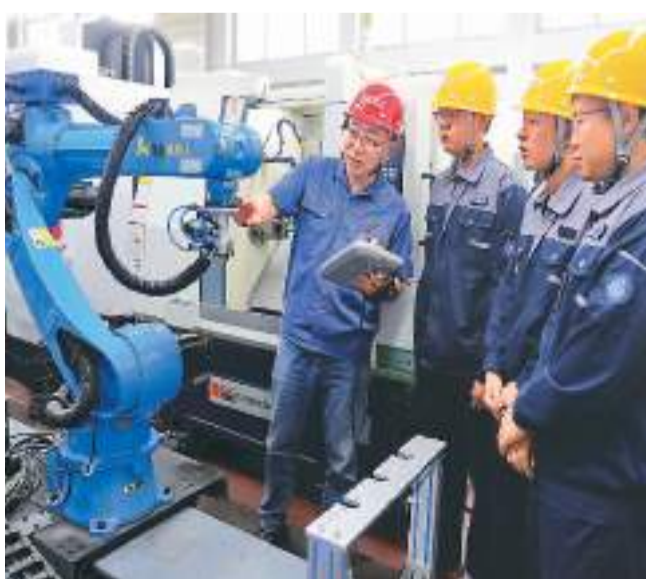
河北省秦皇岛市秦皇岛职业技术学院教师向企业工程师讲解工业机器人技术。

一方面，在重点行业深度推进产教融合。在新一代信息技术、集成电路、人工智能、工业互联网、储能、智能制