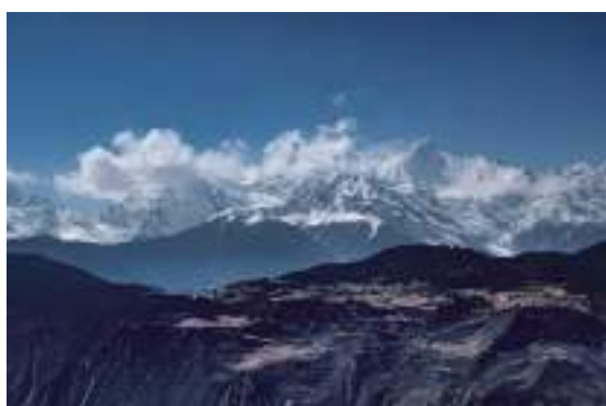
The view of the Meri Snow Mountain compares with what's outside the walls.