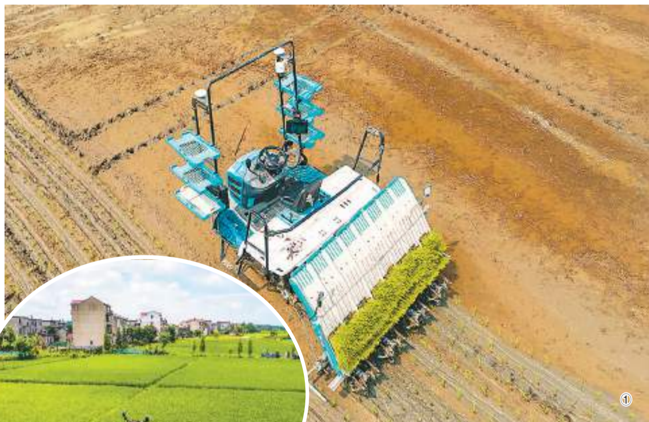
图①：在江苏省兴化市钓鱼镇现代农业产业示范园区，无人驾驶插秧机进行智能化插秧作业。

据显示，今年麦收，机械化收获占比超过99%。其中农业农村部农业机械化总站与中国农业大学联合打造的农机北斗大数据平台上，有超过12万台装有北斗导航的收割机上线，整个收获期共获取其作业信息50.5亿条，数据量超过30T。