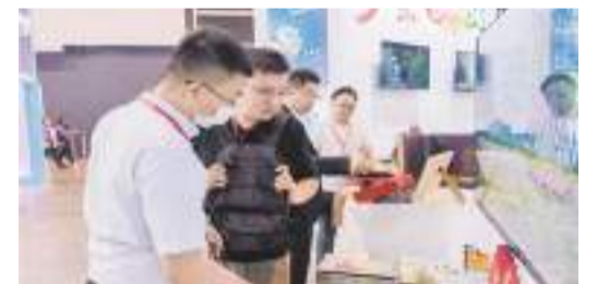
游客在江門展位了解江門旅游產品。