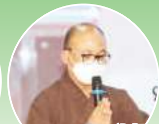
Duta Kshanti 法师 念诵经文