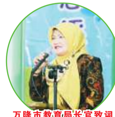
万隆市教育局局长官致词