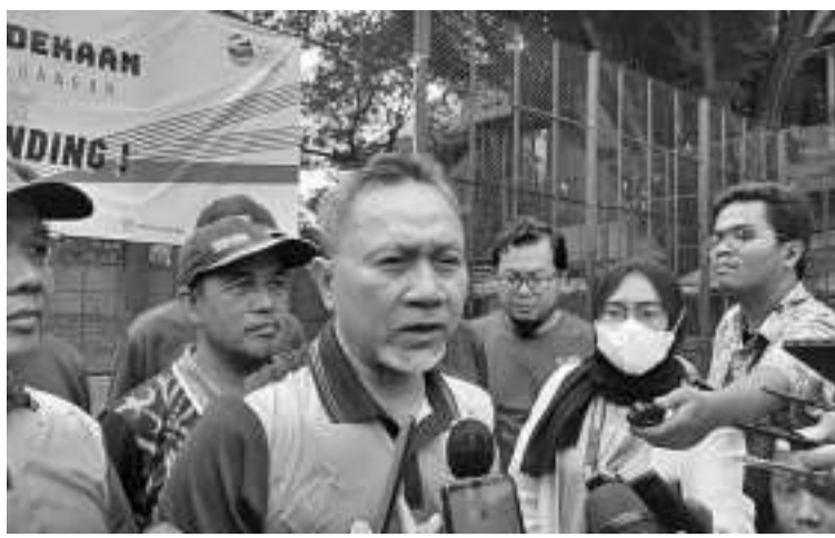
巴布亚新几内亚中小微企业将接受培训 7月6日,贸易部长祖基菲(Zulkifli Hasan)声称,为协助巴布亚新几内亚推动出口活动,我国将向该国的1000家中小微企业提供出口商培训。

统的见证下,印尼和巴布亚新几内亚的代表也签署了谅解备忘录。祖基菲称,印尼和巴布亚新几内亚有许多共同之处,因为两国仍属于同一个文化族群,所以希望在今后能建立一个更密切的合作关系,比方说推动人力资源,交通运输和能源等领域的发展。他补充说:“我们也可以提供电力供应合作,由于刚开始发展,巴布亚新几内亚的电力价格较高,我们这里只有6仙美元,他们那里就要37仙美元,因此我们可以提供协助。” (Sm)