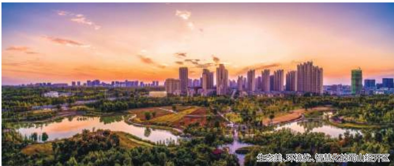
生态美、环境优、智慧化的蜀山经开区

山脚下,水库旁。有一个被中外投资者及社会各界称为“最美‘袖珍’开发区”的合肥蜀山经济技术开发区,也是此次“安徽开发区巡礼”的第一站。11.6平方公里的面积,智慧化的服务孕育出了一大批优质企业,为安徽经济高质量发展注入了澎湃动力。