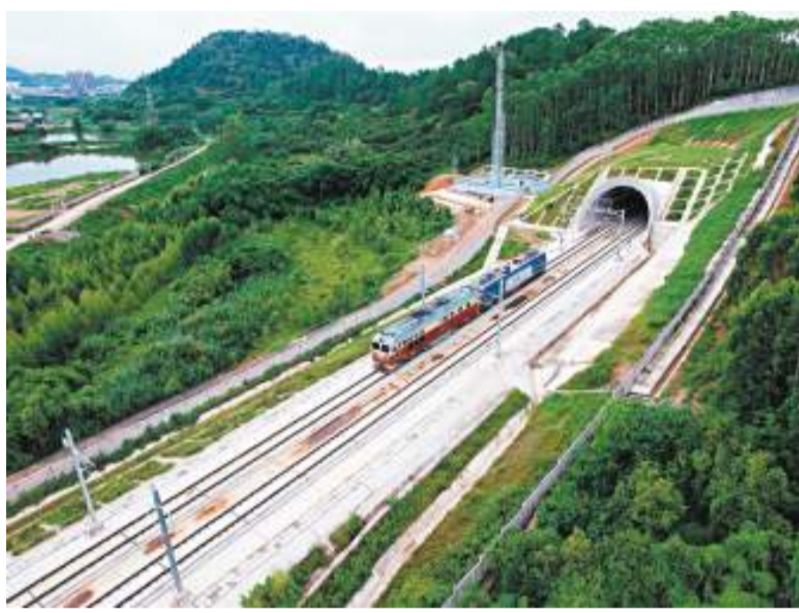
廣汕高鐵路啟動熱滑試驗，全線即將進入聯調聯試階段。

香港文匯報訊（記者方俊明廣州報道）香港文匯報記者日前從廣鐵相關部門獲悉，繼續深高鐵路、廣東進入「市市通高鐵路」之後，廣東在全國可望率先實現「市市通時速350高鐵路」。其中，廣汕高鐵路最快於今年9月開通，廣湛高鐵路擬明年通車，灣區高鐵路網延伸貫通粵東、粵西地區。據最新規劃，到2025年，廣東高鐵路通車里程佔到全省鐵路超53%，將實現廣州與灣區各市1小時通達，與省內其他地級城市間2小時內通達，與鄰近省會城市3小時內通達。