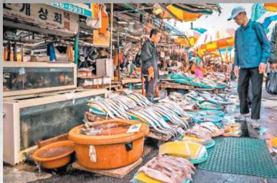
隨着日方準備將核污水排海，韓社會焦慮蔓延，有魚販擔心被迫轉行。網上圖片

另外，民建聯立法會議員葛珮帆指出，收到不少市民反映擔心日本排放核污水對全球海洋生態造成不可逆轉的傷害，禍延後代。她認為，特區政府必須作出預案，一旦日本一意孤行，必須立即禁止進口福島周邊地區的海產，及增加人手和加強檢測來自日本其他地區食品，以保障香港市民的健康。