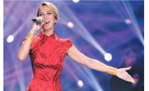
◆在2016年《我是歌手》舞台上，李玟穿上當年在奧斯卡表演的「戰袍」獻唱《月光愛人》。

鮮少看到華語歌手站在國際舞台上表演，李玟卻做到了！李玟是首位登上奧斯卡的亞洲歌手，於2000年為李安執導電影《臥虎藏龍》演唱主題曲《月光愛人》，憑着流利的英語，同時演唱中文、英文版，電影在歐美影壇獲得高評價，並且勇奪第73屆奧斯卡最佳外語片。她演唱的《月光愛人》當時也入圍奧斯卡，為此在2001年的頒獎禮上登台演唱英文版。李玟當天在奧斯卡頒獎禮的舞台也毫不怯場，她身穿紅色改良旗袍禮服大顯高音，現場由管弦樂團伴奏，開全味獻唱展現實力。李玟是唯一一位曾獻聲NBA開幕式的華語歌手，亦是首位也是唯一一位登上世界盃開幕式舞台並演唱了單曲《Colors Of The World》的亞洲歌后，同時也是唯一在米高梅亞洲演唱會上受邀請擔任嘉賓的歌手。2016年，李玟獲得湖南衛視歌唱真人騷節目《我是歌手第四季》「歌王」稱號。2017年發行音樂單曲《18》，獲得亞洲金曲大賞年度華語音樂至尊獎。2022年9月，一段李玟在《中國好声音》晉級錄製現場質問導演組的視頻曝光，視頻中身為導師的李玟疑似現場發瘋，對導演組大喊：「瞎的！大家都在看，導演請給我一個遊戲規則！」同年，她與葉蒨文、楊千嬅、周筆暢等參演《聲生不息·港樂季》。