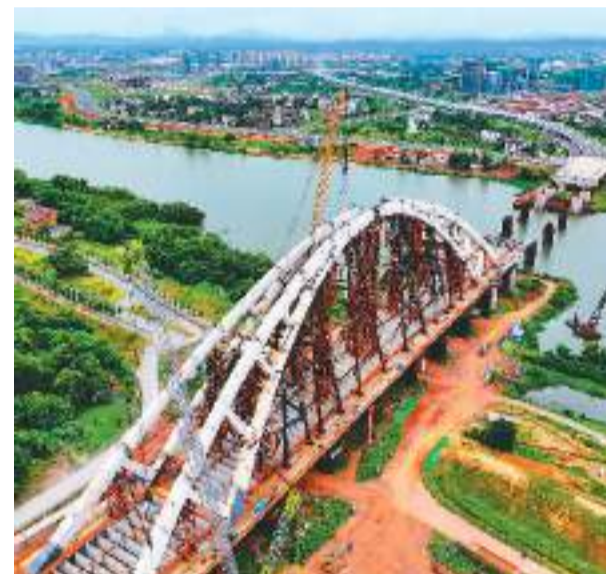
正在建设中的江西省赣州市创业大桥,是横跨章江的一座特大桥,大桥建成后有助于连接赣州市南北组团和高铁、机场片区,提升城市空间转换效率。图为7月5日,创业大桥钢结构拱架施工现场。

(新华社北京7月4日电 综合新华社驻外记者报道,执笔记者:何毅、常天童、汤洁峰)