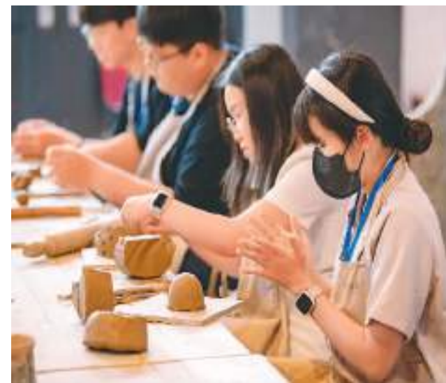
第十届“青春飞扬·书香两岸”浙台大学生文化交流活动近日在金华职业技术学院启动。来自台湾弘光科技大学、龙华科技大学等高校的师生在浙江金华和当地大学生一起深度感受宋韵文化，体验非遗传承。图为在金华职业技术学院婺州窑陶艺制作室里，两岸学子一起体验非遗婺州窑陶艺制作过程。