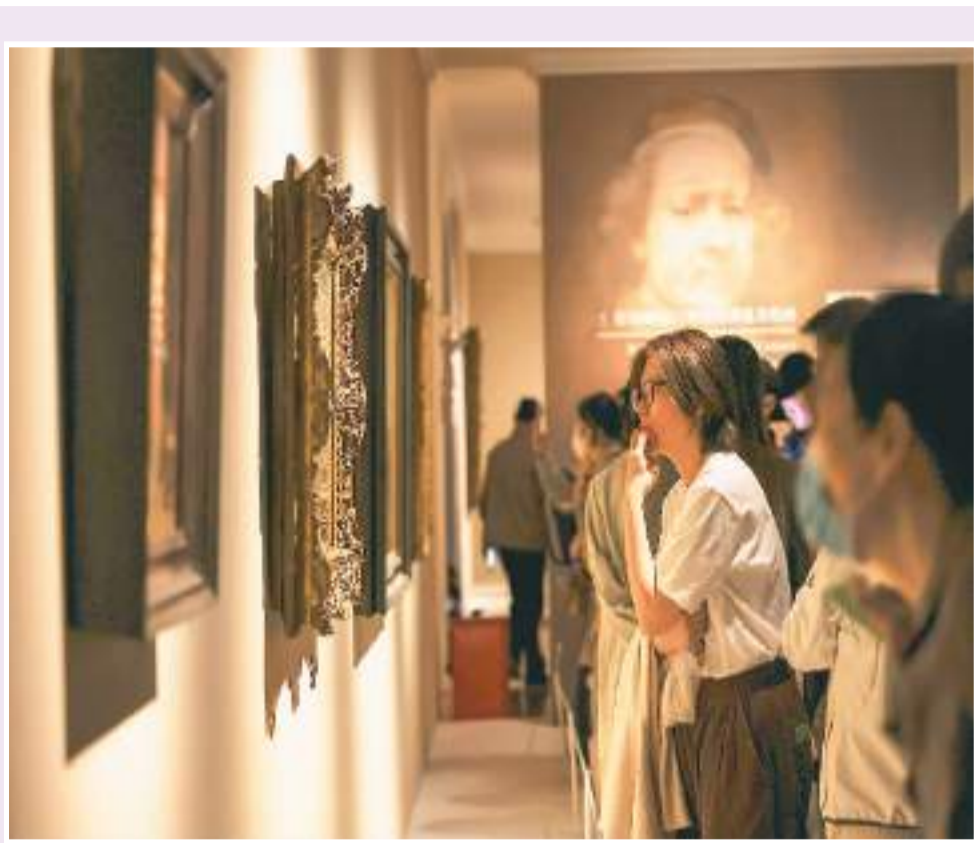
▲成都市美术馆首个儿童美术馆之夜现场导览 ▲观众在“今夜无眠·上博十二时辰艺术嘉年华”活动上参观展览