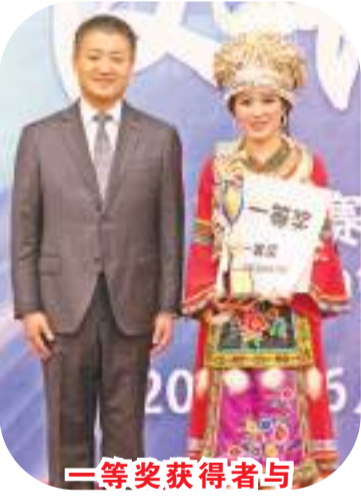
二等奖获得者与陆慷大使合影