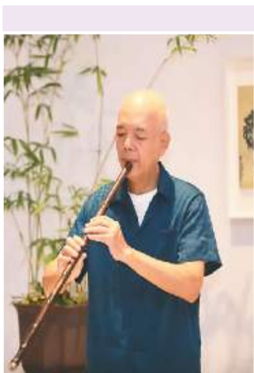
▲关山月美术馆“仲夏轻音·古琴雅集”美术馆之夜现场

因夏天昼长夜短，人们有更多的活动时间。美术馆大多选择在夏季推出展览夜场。事实上，国外很多美术馆会根据昼夜时间差调整开放时间的传统，开放时间分为夏令时和冬令时，目的是方便和吸引更多观众来美术馆。魏祥奇说：“在夏季延长开放时间值得称赞，观众不仅可以享受文化大餐，还能消暑纳凉，可谓便民之举。”