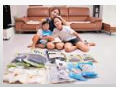
有韓國家庭囤積海鹽。

該負責人還稱，韓政府將在與IAEA、日本政府的緊密合作下，繼續關注雙方提出的處置和監測計劃是否得到切實落實。同時，韓政府將把國內沿海核輻射監測站，從目前92個增至200個，大幅加強對海洋與水產品安全的管理。