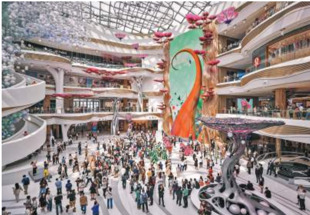
◆市場需求轉弱，令中國內地服務業增速有所放緩。