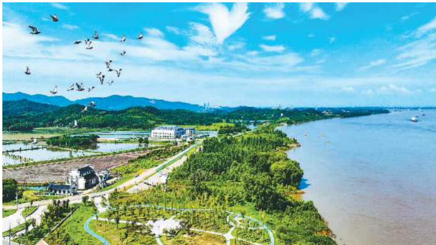
近年来,安徽省芜湖市繁昌区持续推进长江岸线生态修复,守护一江碧水,走“生态优先、绿色发展”之路。图为七月五日,繁昌区新港镇长江岸线水清岸绿,蓝天白云下,鸟儿自由飞翔,船舶有序航行,风景如画。

此外,预计今年盛夏,西北太平洋和南海热带气旋生成数为6—9个,其中有3—5个登陆我国。盛夏热带气旋活动路径以西行和西北行为主,可能影响我国华南和东南沿海地区。