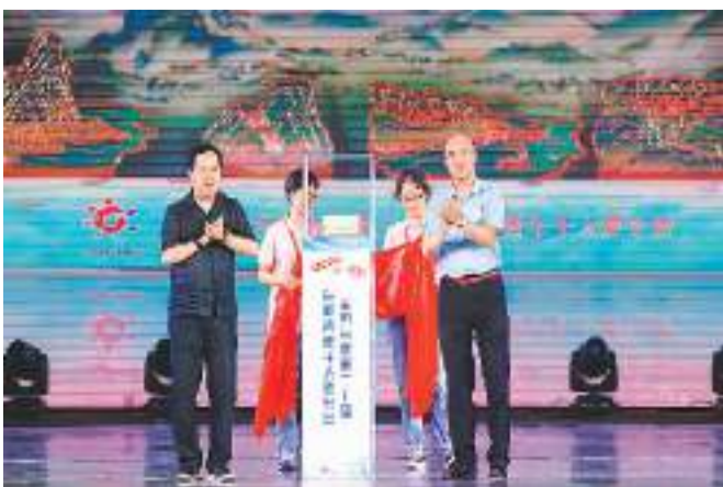
图为本届夏令营开营纪念用品千里江山图。