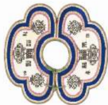
▲“福禄寿喜”桃花围嘴

“观众可能会觉得很多展品既陌生又亲切。陌生是因为当年的很多工艺形制、配色、图案在今天已经很少见到，亲切在于很多工艺类型如今还在传承发展。”清华大学艺术博物馆常务副馆长、展览总策划杜鹏飞表示，希望展览能够为复兴传统文化、振兴传统工艺、促进工艺美术教育发展学科建设，提供一种温故知新的视角。