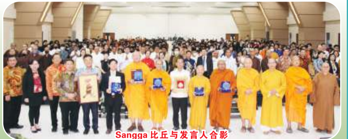
Sangga比丘与发言丛合影