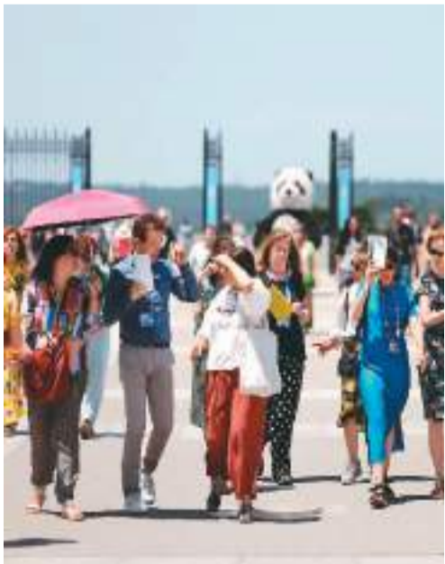
西班牙今年夏天首波热浪目前正席卷该国大部分地区，8个自治区已发布高温预警。图为近日，游客顶着酷热在西班牙马德里游览。

厄尔尼诺现象是一种自然发生的气候模式，与热带太平洋中部和东部的海洋表面温度变暖有关。它平均每2至7年发生一次，通常持续9至12个月。厄尔尼诺现象会引发各地天气变化，例如通常干旱少雨的地区可能发生洪涝、多雨地区可能出现干旱。