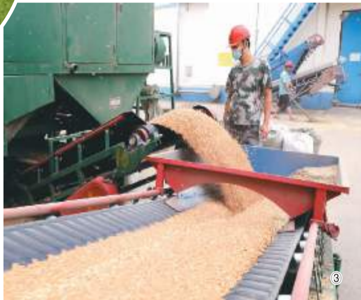
图③：在位于山东省东营市东营区黄河路街道的东营市财鑫粮食产业有限公司，工人利用液压翻板、输送机等设备将小麦输送入库。