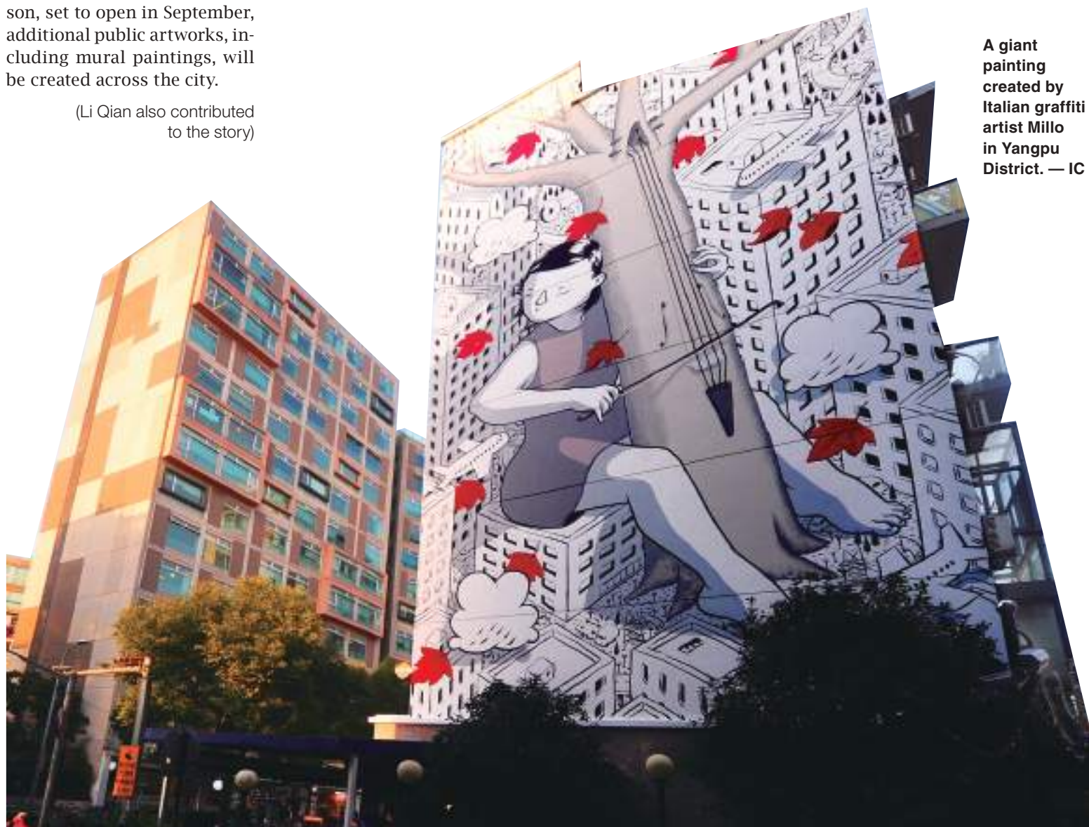
A giant painting created by Italian graffiti artist Millo in Yangpu District. — IC