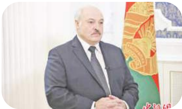
资料图:白俄罗斯总统卢卡申科。