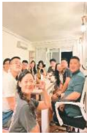
作者（右一）和同在西班牙的中国留学生聚餐。