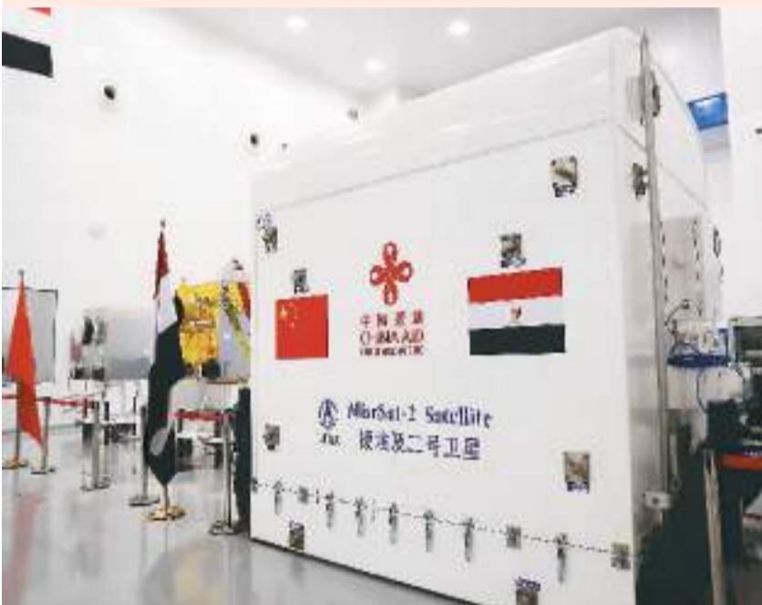
中国政府援助埃及二号卫星初样星交付仪式6月25日在埃及航天城卫星总装集成测试中心举行。此次交付使埃及成为首个具备卫星总装、集成和测试能力的非洲国家。图为交付仪式现场。

一年多来，中国携手各方合作伙伴，推动全球发展倡议走深走实，给各国带来实实在在的好处。