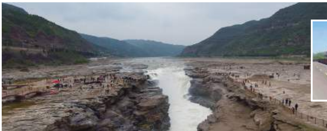
An aerial view of the waterfall.

The exposure of local authorities enclosing the Qinghai Lake with wire mesh in June to charge tourists for admission fees resulted in a large number of social media users complaining about how unsightly