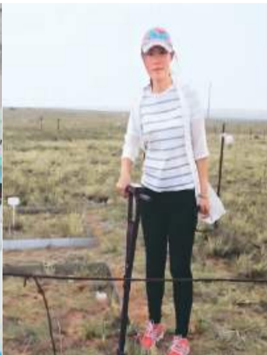
高群在野外进行土壤采样