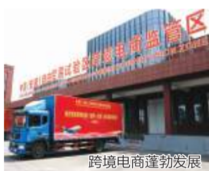
跨境电商蓬勃发展

境,更加便捷的智慧化服务,公司也在持续发展壮大。目前,正规划建设一块占地50多亩的综合园区,未来将继续在蜀山经开区‘开枝散叶’。”