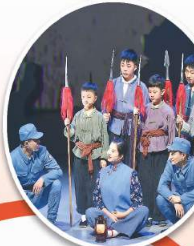
儿童剧《新安旅行团》剧照

近年来，淮安市发扬地方红色资源优势，教育引导青少年深刻认识中国特色社会主义道路、理论、制度和制度和文化，探索培养拥有“四个自信”的青少年。