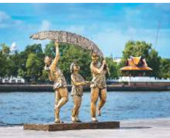
▲许鸿飞雕塑世界巡展·曼谷站现场

据悉，本次展览是许鸿飞雕塑世界巡展的第48站。2013年6月，许鸿飞在澳大利亚悉尼开启了个人雕塑世界巡展的海外首站。以此为起点，许鸿飞与“肥女”系列雕塑走进20个国家和地区的30余座城市，用充满爱和欢乐的雕塑与世界互动，为世界了解中国、了解广东打开了一扇生动、亲切的窗口。