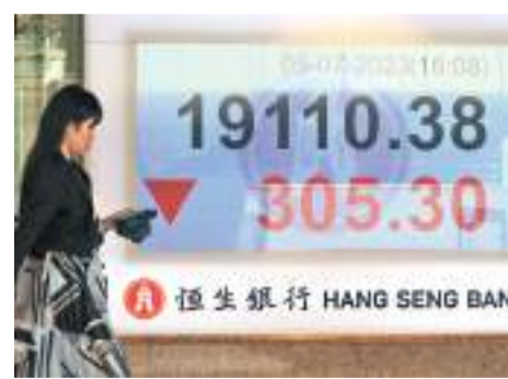
◆港股5日調整，大市成交870億元。中新社

香港文匯報訊（記者 周紹基）內地及香港經濟數據回軟，憂慮經濟復甦前景，港股再度下跌，全日跌305點，收報19,110點，僅守住19,000點大關，大市成交870億元（港幣，下同）。內地數據遜預期，財新中國6月服務業PMI為53.9遜預期，較5月57.1低3.2個百分點。市場人士指出，港股連升兩日後，短期技術走勢有轉弱跡象，資金也未見積極流入，若情況持續，相信港股會進一步回落，呼籲投資者保持審慎策略。此外，財經事務及庫務局局長許正宇表示，股票交易印花稅率的上調，不會影響港股交易活動，股市整體成交額受股價下跌的影響較大，而有關係變動則較多為外圍因素轉變所導致。