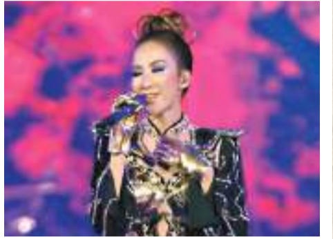
◆李玟曾在世界各地舉行巡唱。

香港文匯報訊（記者林林、章馨憶）李玟是美籍華語流行女歌手，1975年香港出生，原名「李美林」。1993年以參加香港無線電視新秀歌唱大賽獲得亞軍，與香港華星唱片公司簽約正式出道，1994年6月於台灣發行首張個人專輯，《我依然是你的情人》成為李玟出道的代表作。她能歌擅舞，歌聲充滿張力，具有一定的創新意義——為台灣歌壇帶來美式唱腔風潮。1997年5月，其第5張華語專輯《每一次想你》面世，這張專輯主打她的「玖式唱腔」，李玟在音樂上的個人特色與天賦逐漸嶄露頭角。1998年，發行音樂專輯《Di Da Di 暗示》，在亞洲取得180萬張銷量；同年，在台灣地區舉辦「萬人迷」演唱會；演唱迪士尼動畫電影《花木蘭》中文主題曲《自己》。1999年，發行首張英文專輯《Just No Other Way》，全球銷量達到200萬張。