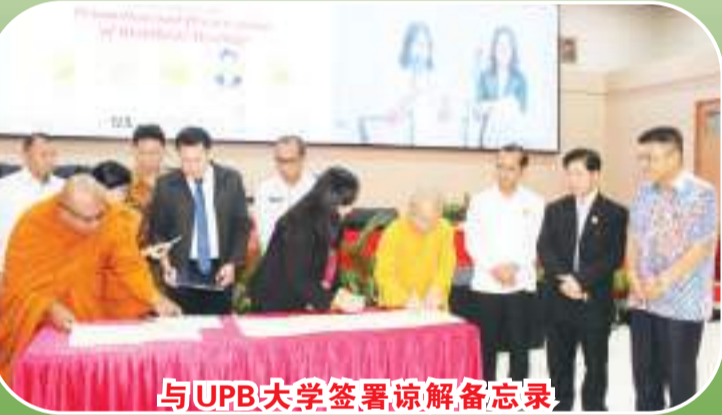
与UPB大学签署谅解备忘录