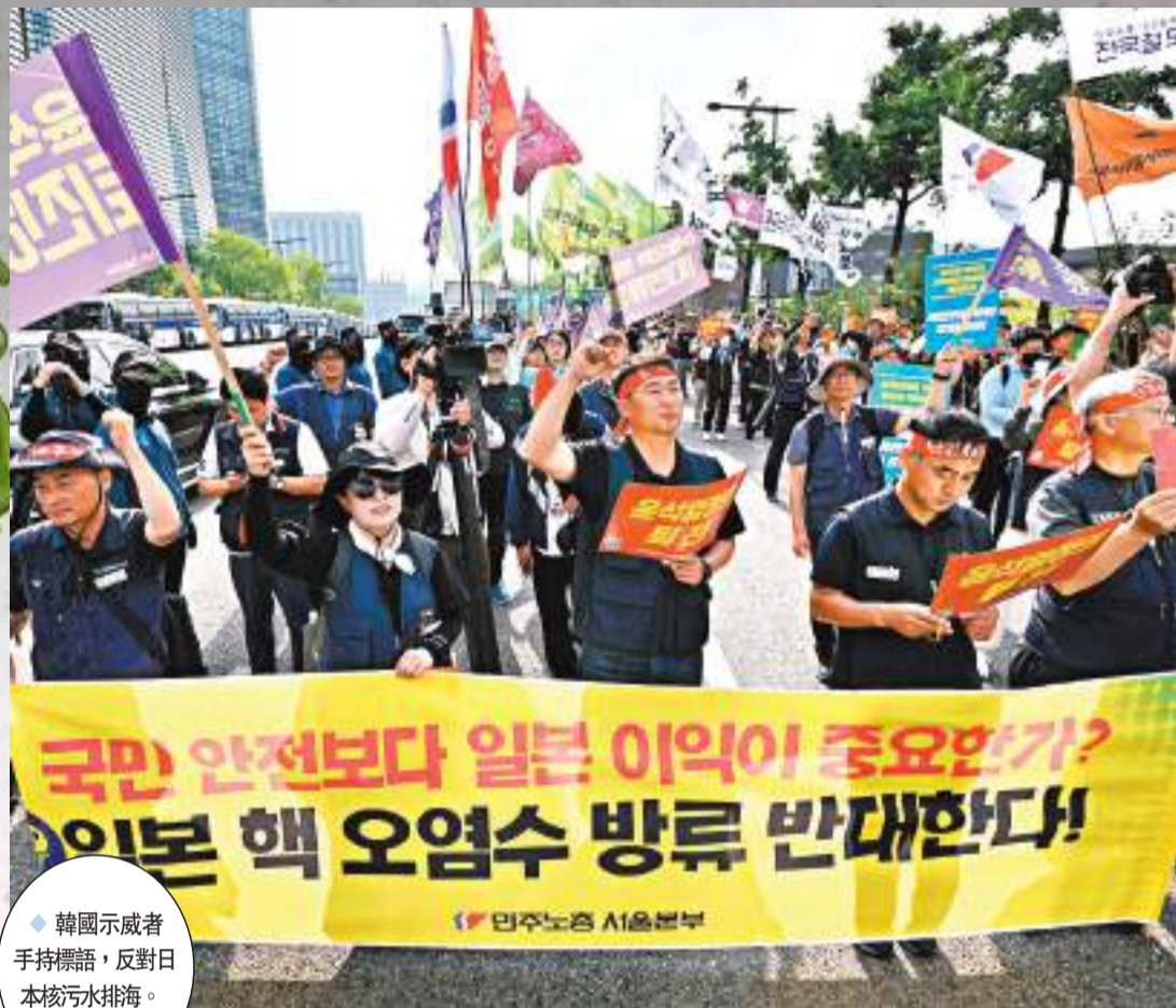
◆韓國示威者手持標語，反對日本核污水排海。

生態環境部相關負責人強調，要高度警惕這種「惡人先告狀」，企圖混淆視聽、蒙混過關的圖謀。我們反對的是日本福島核污水排海，從來沒有反對核電廠正常運行排放。日本福島核污水有關誤導宣傳代替不了事實真相，方案設計代替不了工程實踐，口頭承諾代替不了真實結果，精心包裝的方案掩蓋不了企圖轉嫁危害的圖謀，有限的選擇性抽查代替不了長期公正的國際監督。