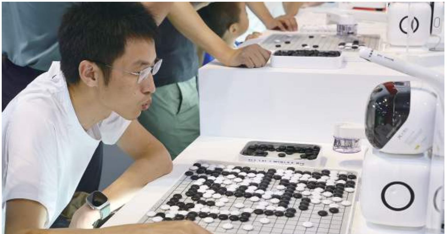
A visitor plays go chess with a robot at World Artificial Intelligence Conference on Thursday in Shanghai.

More than 20 closed-door industrial negotiation meetings will be held at the WAIC, covering smart agriculture, smart city, metaverse, intelligent retail as well as culture