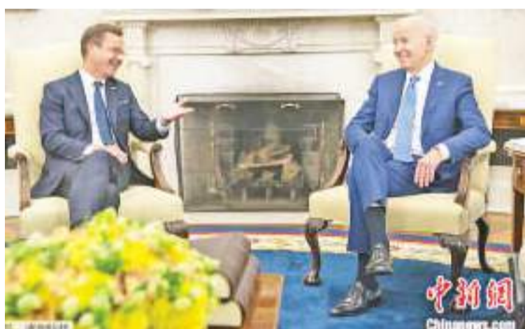
当地时间7月5日,美国总统拜登在白宫会见瑞典首相克里斯特松。

《纽约时报》称,目前距离北约峰会还有不到一周的时间,但由于土耳其方面的持续反对,瑞典短期内不太可能加入北约。《纽约时报》认为,这个问题对北约而言至关重要,北约不愿在年度峰会上表现出内部分裂的迹象。