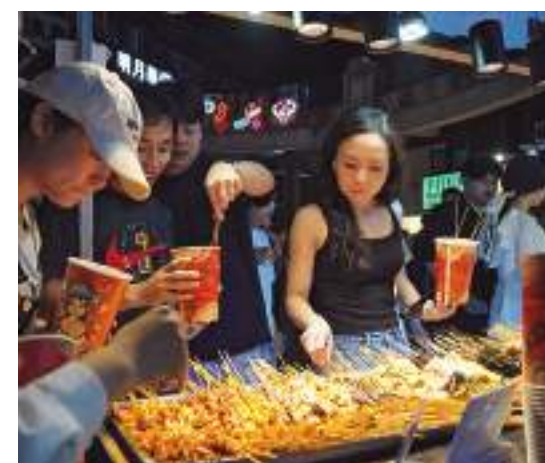
People attend various activities during the 2023 Shanghai Night Festival.