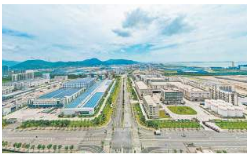
中印尼“两国双园”。

今年以来,中印尼“两国双园”签约不断:印尼—福州经贸对接会暨项目签约仪式活动现场,集中签约15个项目、总投资216亿元;中印尼“两国双园”经贸合作交流洽谈会在福清集中签约10个重点项目,总投资45.5亿元;中国(福建)—印尼共建