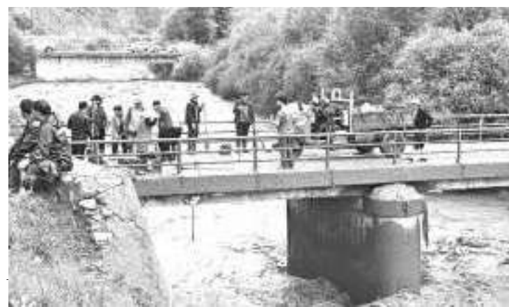
7月11日,在甘肃省甘南藏族自治州夏河县麻当镇,当地组织力量进行清淤。记者从甘肃省应急管理部门了解到,7月10日23时34分许,甘肃省甘南藏族自治州夏河县麻当镇章子沟村发生泥石流灾害。截至11日12时许记者发稿时,灾害已造成2人死亡,2人失联,7人受伤。

【环球时报-环球网报道】在7月11日的中国外交部例行记者会上,有记者提问称,国际原子能机构总干事近期访问韩国、新西兰期间多次发表福岛核“处理水”可以饮用、游泳,与别国核电站排水一样没有危险等争议言论。此外,最近有不少核领域的专家,包括参与评估工作的核专家对此发表了不同的看法,请问发言人对此有何评价?