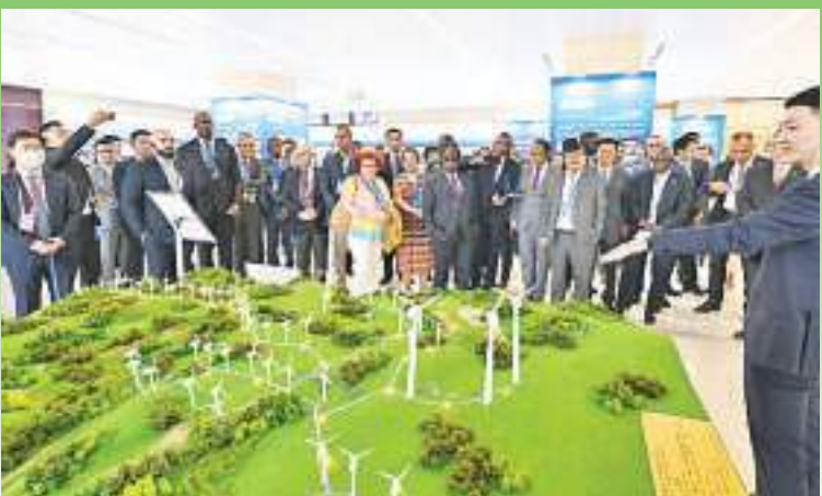
7月6日，驻华使节在国机集团国际化经营成果展厅内参观由该集团承建的肯尼亚基佩托风电项目沙盘。

设、旅游发展等方面开展更多合作。”午后，使节们来到国机集团中国农机院，实地参观农业装备技术全国重点实验室、国家工程研究中心和装备制造展览室外展区。