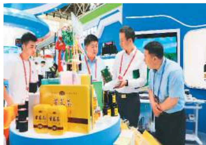
7月10日,第29届中国兰州投资贸易洽谈会闭幕。本届兰洽会共达成签约合同项目1172个,参会宾客超4万人,吸引境内外参展企业1600余家,集中展示了30大类、上万种产品,会展规模、签约项目数量均创历史新高。图为参会者在本届兰洽会生物医药馆了解展品情况。

据介绍,今年全国节能宣传周将举办重点行业企业节能降碳行动、全国低碳日、公共机构节能降碳实践、绿色低碳生活、全国节能宣传周进校园、全国节能宣传周进家庭等宣传活动。