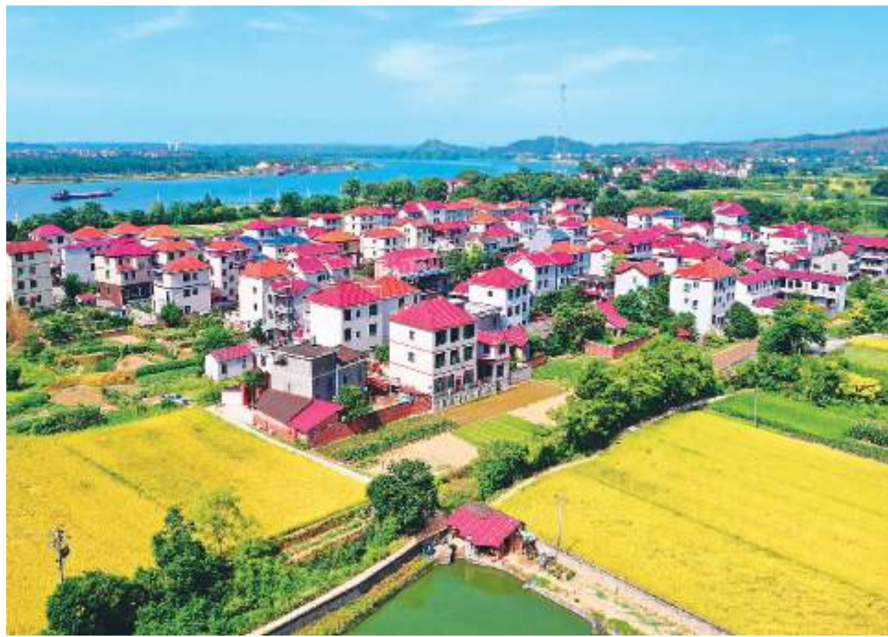
江西省吉安市泰和县积极推进美丽乡村建设,开展村庄环境综合整治,做好农村污染防治,建立农村垃圾收集、转运、处理体系,打造环境优美、生态良好、乡风文明的美丽新农村。图为7月9日,在泰和县澄江镇南洲村,红瓦农房与金色田园相映成景。