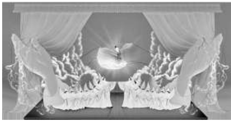
《纽约客》配发的揭批“神韵”真面目插图

《纽约客》采访时说,“神韵演出”实质是一种对中华文明、中国舞蹈界的矮化、丑化宣传。