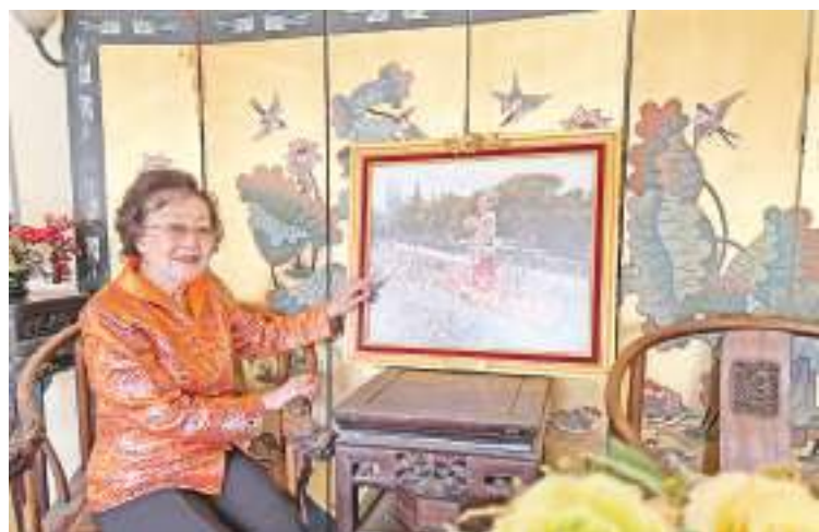
图为4月29日,美国知名侨领张素久介绍“北京奥运花车”参加美国玫瑰花车游行时的盛况。