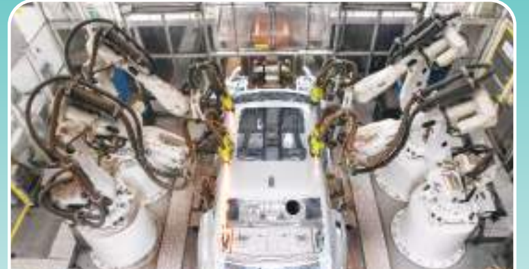
在位于吉林长春的一汽红旗繁荣工厂焊装车间内,机器人焊装车辆零部件(7月6日摄)。

新华社香港7月10日电 新华社记者刘云非 今年是疫后复苏的关键之年,作为全球经济最具活力的地区,亚太地区面对重重挑战显现经济韧性。作为亚太地区最重要的经济体之一,中国经济增长潜能巨大,继续发挥引擎作用,为亚太经济增长作出重要贡献。