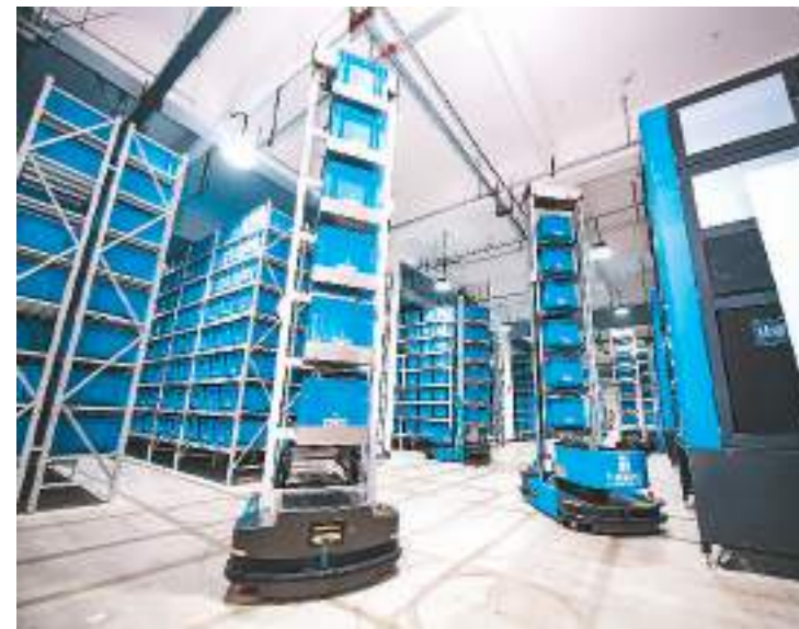
新疆维吾尔自治区昌吉回族自治州现代医药物流仓储基地今年4月正式投入运营，具备批发配送和应急储备功能。图为7月3日，该基地药品库，智能拣选机器人在进行药品调运。

“国家药监局积极构建以国家药品标准为主体、省级标准为补充的中药标准体系。”赵军宁介绍说，颁布实施2020版《中国药典》，收载中药标准