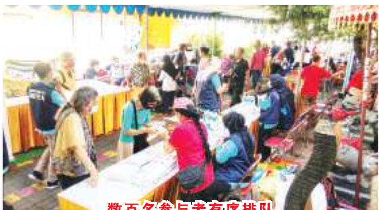
数百名参与者有序排队