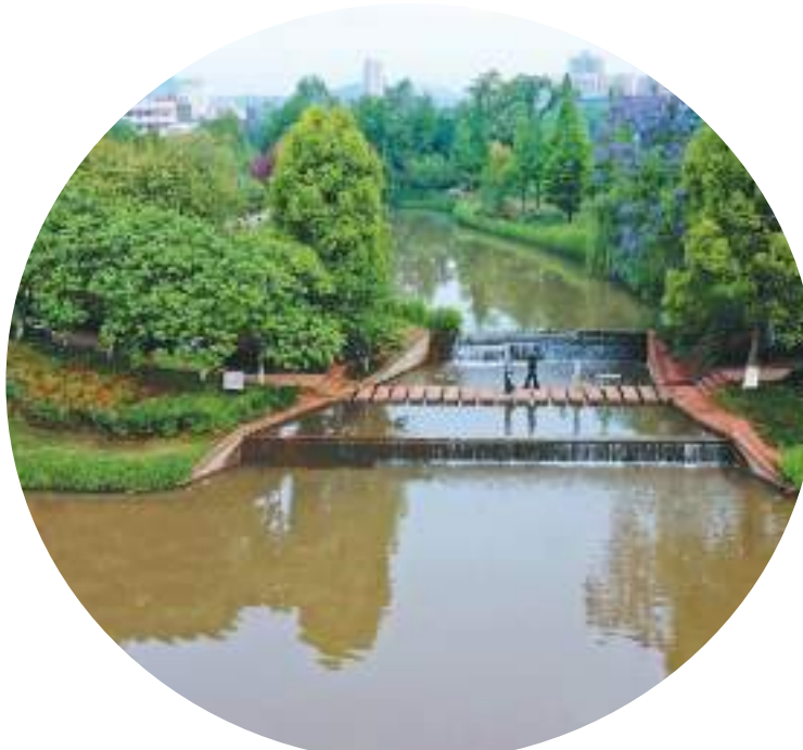
图为5月14日，四川省眉山市仁寿县城区的一个“口袋公园”，绿树成荫，花树交辉，市民在悠闲地散步、健身。

此外，项目启动仪式上，中国初级卫生保健基金会与北京清华长庚医院签约共建“微创国际医学中心”。北京清华长庚医院作为重要支持单位，支持微创国际医学中心建设成为中国微创医学领域的顶级医疗平台、医师培训平台、技术创新转化平台和国际交流平台，成为基层先进微创技术推广应用的领航者，构建微创医学的“产学研用”一体化协同创新机制。