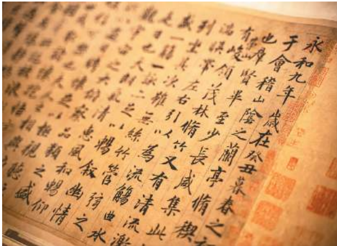
元代赵孟頫临《兰亭序》，无锡博物院藏。