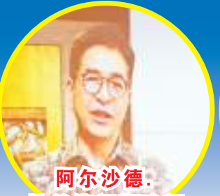
阿尔沙德·拉希德视频致词