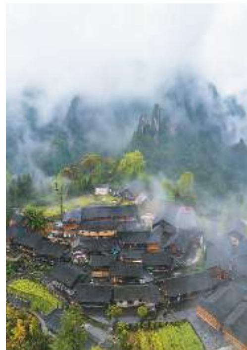
湖南省湘西土家族苗族自治州花垣县双龙镇十八洞村，山峦叠翠，云雾缭绕，美不胜收。