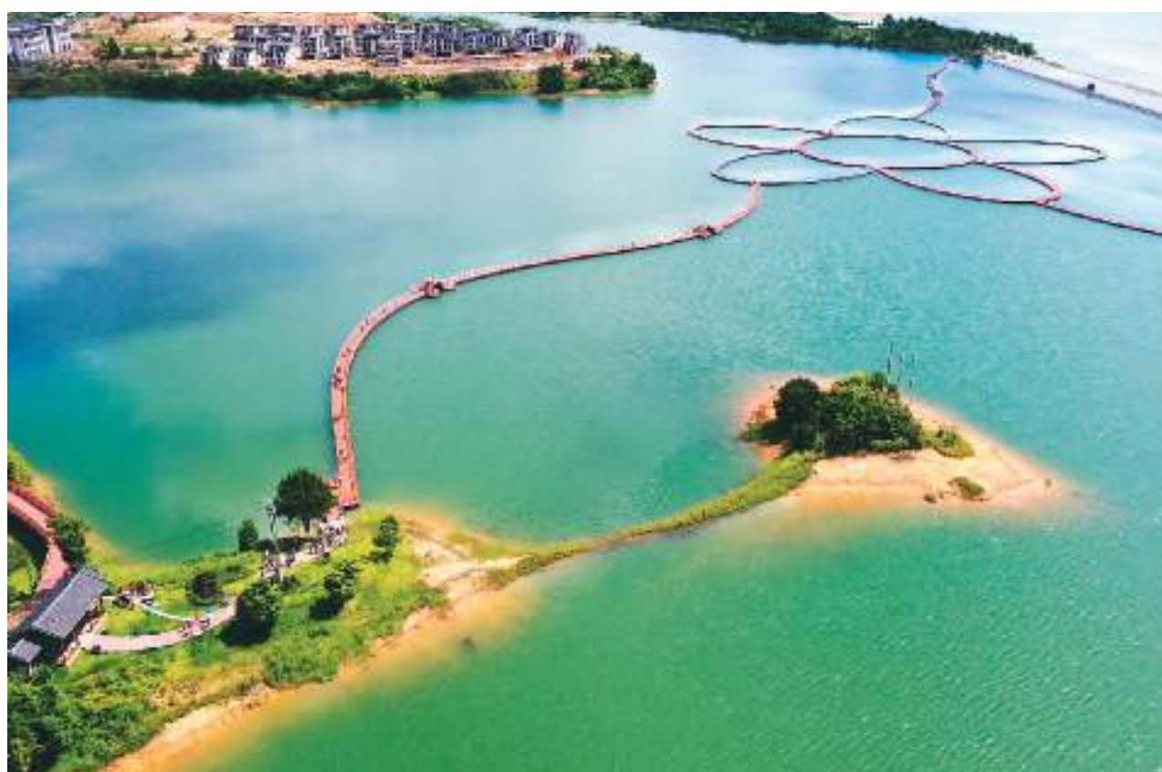
7月，福建省宁德市古田县翠屏湖水域天朗气清，风景宜人，吸引不少游客前来。近年来，古田县依托翠屏湖环湖旅游资源，积极优化税收营商环境，着力推动旅游产业高质量发展。图为翠屏湖景色。

香港邮政表示，此次推出特别邮票及相关邮品，旨在宣扬这项香港非物质文化遗产，期望传统手工艺得以传承。