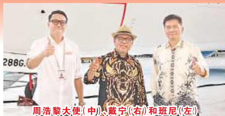
周浩黎大使(中)、戴宁(右)和班尼(左)