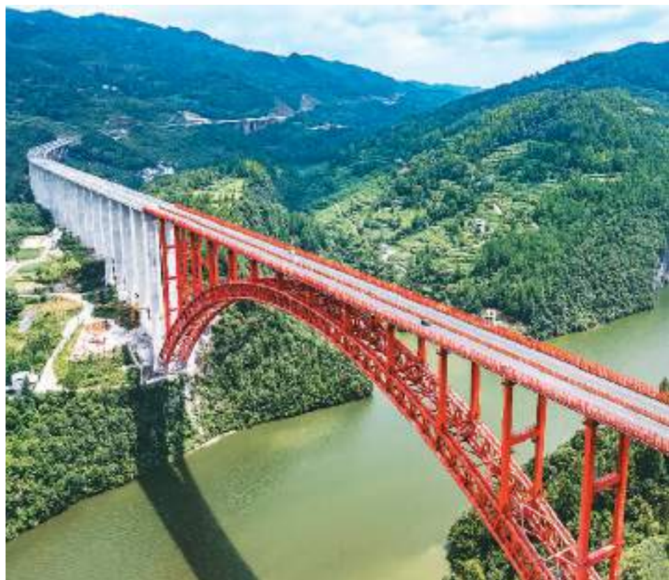
七月十日，贵州省德江至余庆高速公路全线建成通车。德余高速公路建成通车对完善当地高速公路路网结构、推动武陵山集中连片区域经济快速发展具有重要意义。图为当日，车辆行驶通过德余高速公路乌江特大桥。

全球共享发展行动论坛首届高级别会议由国家国际发展合作署主办，主题为“中国的倡议，全球的行动”，10日在北京开幕。