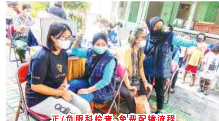
正/负眼科检查、免费配镜流程