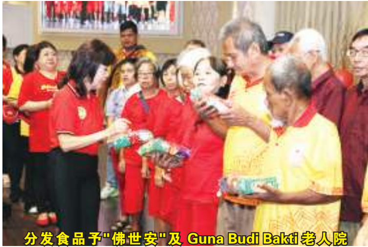
分发食品予“佛世安”及 Guna Budi Bakti 老人院