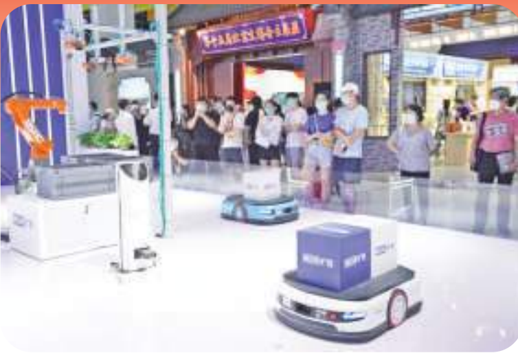
2020年9月6日，观众在服贸会综合展区参观展出的智慧物流机器人产品和操作系统。