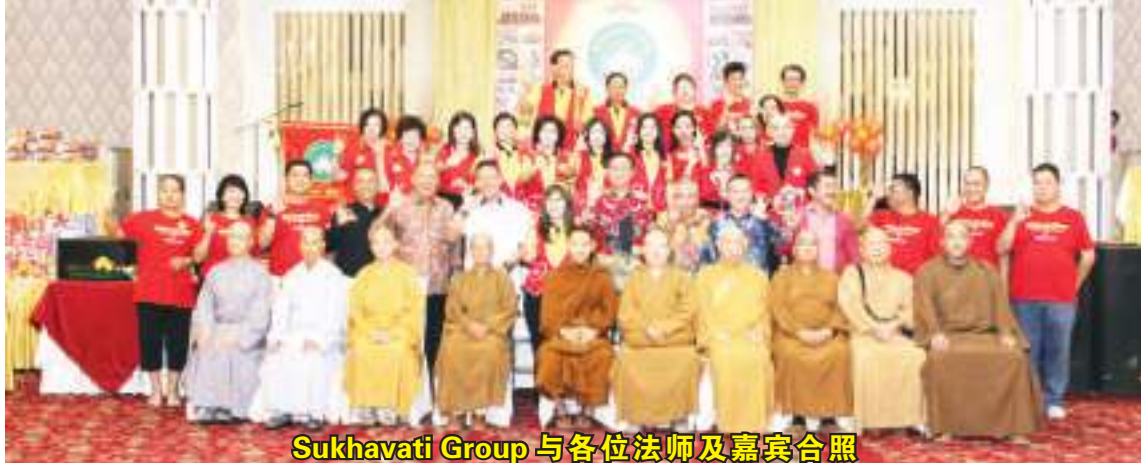
Sukhavati Group 与各位法师及嘉宾合照

状予赞助商,余兴节目包括先后演出,庆典最后在抽奖独唱, Sukhavati Group, Beautiful 排舞团及 Anasui 舞蹈团陈平治报道