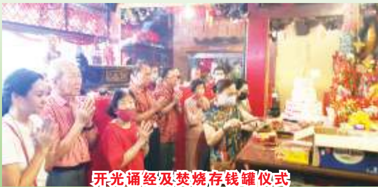
开光诵经及焚烧存钱罐仪式