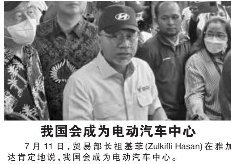
我国会成为电动汽车中心

在未来，政府和韩国驻印尼大使将竭尽全力，使印韩的贸易价值能同韩越的一样多，其中一个办法就是在我国建造现代电动汽车厂作为出口推动力，使印韩双边贸易价值能比韩越交易价值更多。