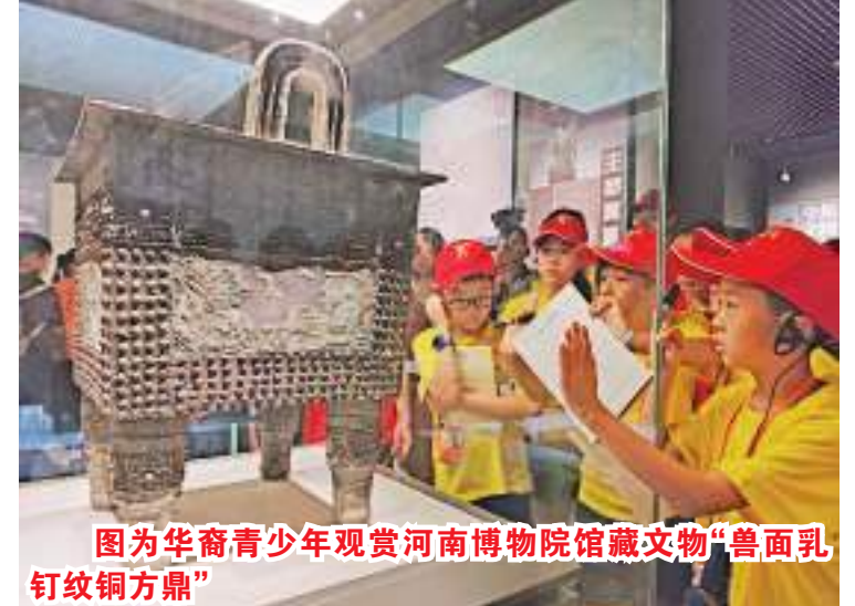
图为华裔青少年观赏河南博物院馆藏文物“兽面乳纹铜方鼎”