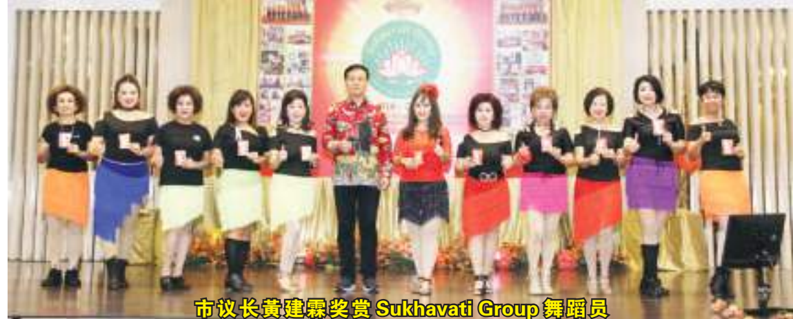
市议长黄建霖奖赏 Sukhavati Group 舞蹈员