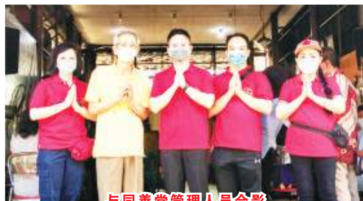
与同善堂管理人员合影