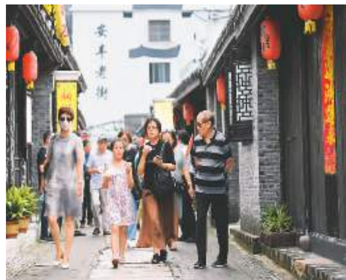
江苏省东台市在优化原有风景名胜区的同时,着力发展传统文化特色旅游,创新文化旅游产品项目,打造一批文旅融合景区。据当地文旅部门统计,2023年上半年,全市共计接待游客超过610万人次。图为7月10日,游客在东台安丰老街游玩。

国家开发银行有关负责人介绍,将持续发挥开发性金融作用,聚焦农业基础设施精准补短板、强弱项,用好农田建设专项贷款,优化信贷资源配置,坚持让利予农,给予农田建设更优惠信贷政策倾斜,为服务加快推进农业现代化持续贡献开发性金融力量。