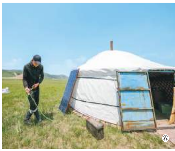
图①：牧民们赶着牲畜行走在迁徙路上。 图②：牲畜在草原上吃草。 图③：牧民格日乐朝格图在聚拢马群。 图④：巴彦温都尔苏木敖特尔服务驿站的党员干部正帮牧民搭建蒙古包。 图⑤：牧民额尔敦巴特尔将毡房的木制房顶装车。 图⑥：格日乐朝格图给发电设备接电。 图⑦：巴彦温都尔苏木的牧民们躺在草地上休息。