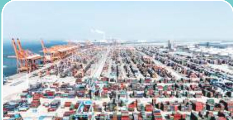
这是广西钦州港集装箱码头(2月25日摄,无人机照片)。