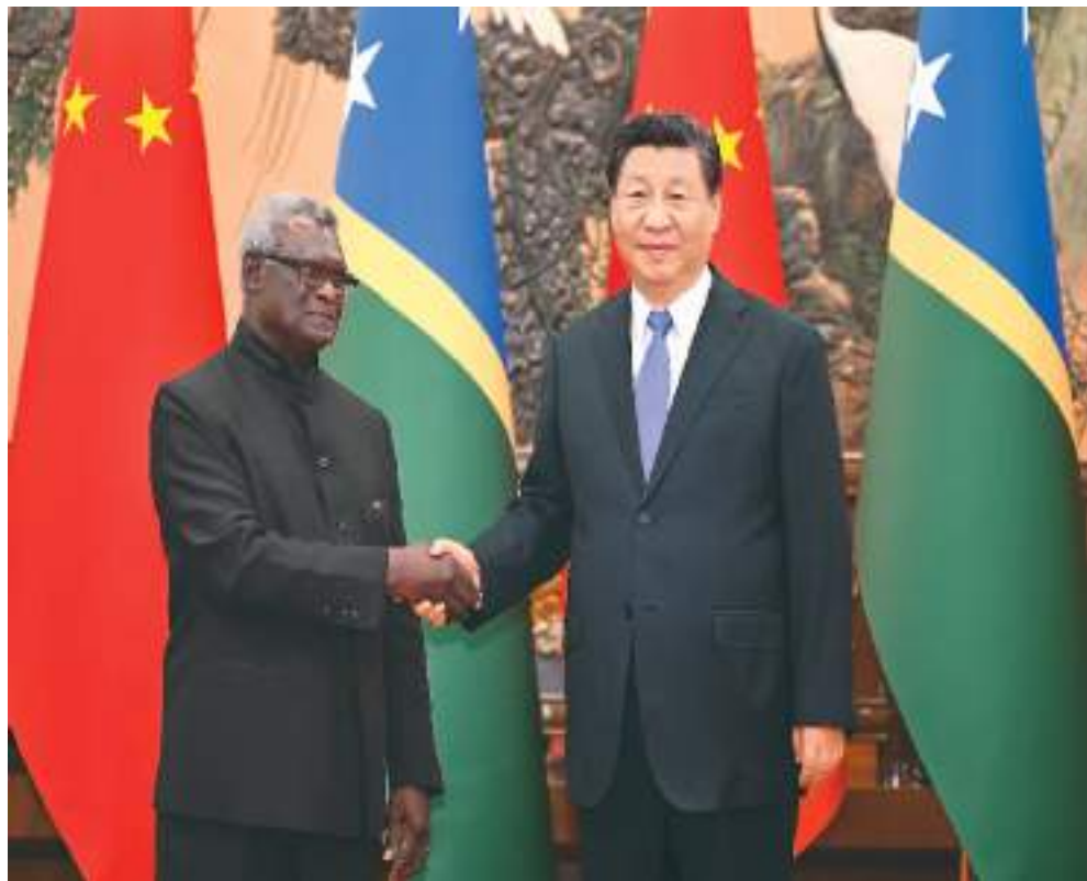
七月十日下午，国家主席习近平在北京人民大会堂会见来华进行正式访问的所罗门群岛总理索加瓦雷。