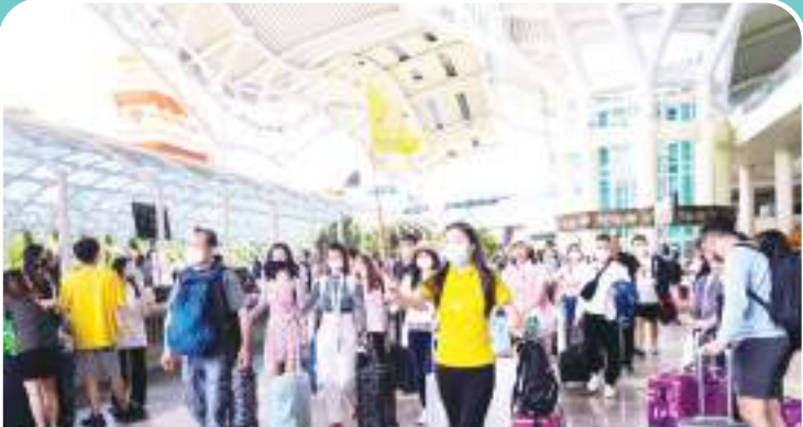
2月12日,在印度尼西亚巴厘岛伍拉莱国际机场,中国游客在领队引导下走出国际航班到达口。