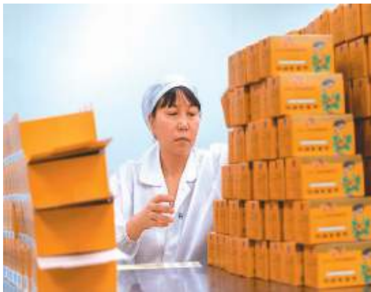
近年来，云南省文山壮族苗族自治州大力推动以三七为主的生物医药产业发展，引导农民标准化、规模化种植。图为5月31日，在该州文山市一家制药企业，工人在包装车间工作。

2022年以来，国家药监局组织全系统深入开展药品安全专项整治行动，查办了一批违法案件，公布了一批典型案例，移送了一批犯罪线索，消除了一批风险隐患，完善了监管制度机制，有力保障了药品安全形势总体稳定。