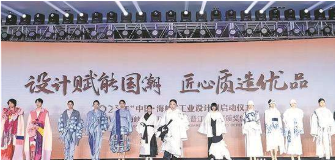
第八屆“海峽杯”工業設計大賽優秀設計作品現場走秀

泉州網6月27日訊(記者許雅玲 黃祖祥 林勁峰 通訊員林錦鑫 文/圖)26日,第八屆“海峽杯”工業設計大賽獲獎作品正式揭曉,139件作品脫穎而出,分別獲評優秀獎、銅獎、銀獎、金獎。其中,由民航物流信息技術有限公司與成都浪尖工業設計有限公司攜手打造的北京大興機場自助行李托運系統作品摘得大賽桂冠,獲最高獎“海峽杯”大賽特別獎。