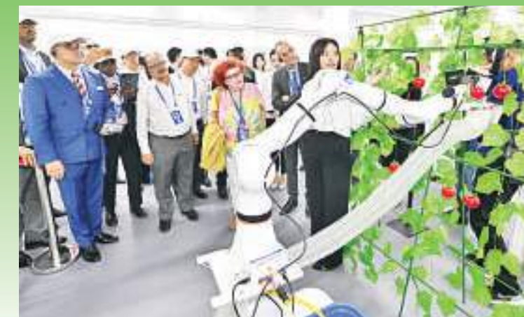
7月6日，驻华使节在国机集团中国农机院观看番茄采摘机器人作业演示。

“印尼与中国已开展了多项深度合作，比如采用中国技术建造的雅万高铁已在联调联试综合检测中达到350公里运行时速，并将于8月开始运营。”狄诺诺说，此次参观让他看到了两国在农业