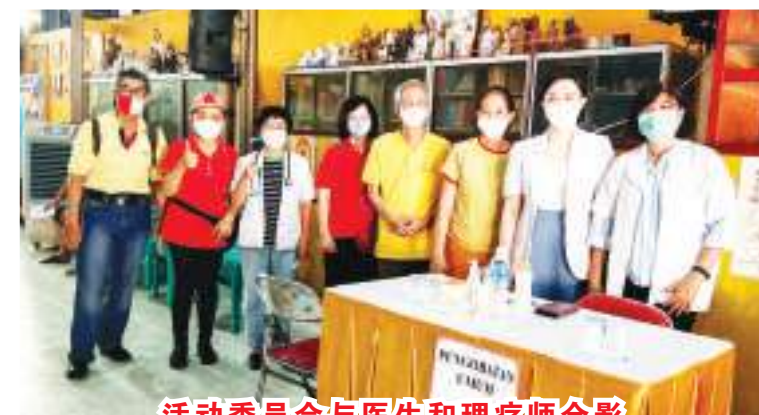
活动委员会与医生和理疗师合影