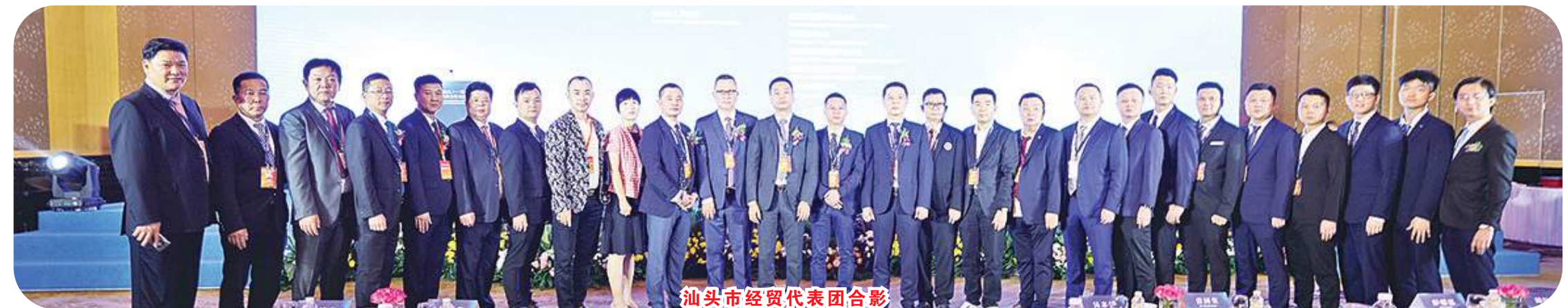
汕头市经贸代表团合影