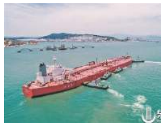
往來泉州的進出港船舶

航與另一艘正在出港的供油船發生碰撞。演練包括險情接報響應、傷員轉運救治、監視監測與警戒、專家會商研判、船舶消防滅火、危化品泄漏處置、水下堵漏作業及溢油回收處置等8個科目。其中,船體水下破損部位堵漏,“對二甲苯”艙內泄漏處置等演練均為省內首次。