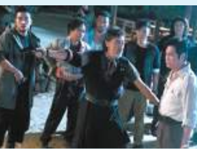
◆視帝羅嘉良與影帝劉青雲門戲。

羅嘉良從沒演過金三角大毒梟角色:「我看很多紀錄片去做功課,看真正的毒梟是如何生活,做過什麼手段。」嘉良跟劉青雲首度合作,兩人戲中同