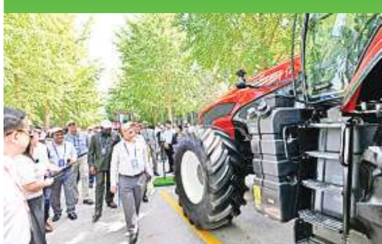
7月6日，驻华使节在国机集团中国农机院参观“东方红”拖拉机。

惬意放松的工作环境 因为地理位置接近赤道，民丹岛终年阳光普照，平均温度为26度左右。岛上除了丰富的劳工及天然资源外，满眼翠绿的热带植物及海滩边各等级的国际度假酒店，随时随地可通过海上运动、高尔夫球场等设施，或者仅躺在离工业园仅步行距离的海边发呆，随时随地可放松的工业园，怎不让人心动？ 本报记者 叶露