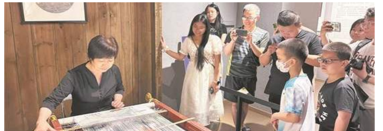
▲非遺活態展示吸引市民遊客參觀

泉州網6月26日訊(記者郭雅瑩 文/圖)24日,在泉州非物質文化遺產館,由市文旅局、市城鎮集體工業聯合社主辦的首屆“泉州人才節”——“走進世遺·遇見非遺”大師展演活動舉行,20多位非遺傳承人、工藝美術大師現場展示泉州花燈製作、江加走木偶頭雕刻等非遺技藝,並帶來南音、泉州提線木偶戲等非遺表演,吸引眾多市民遊客參觀體驗。