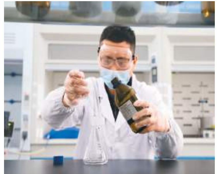
图为4月6日，在江西省吉安市峡江县和美药业有限公司，研发人员正在对即将上市的一款国家I类创新药新产品做测试研究。