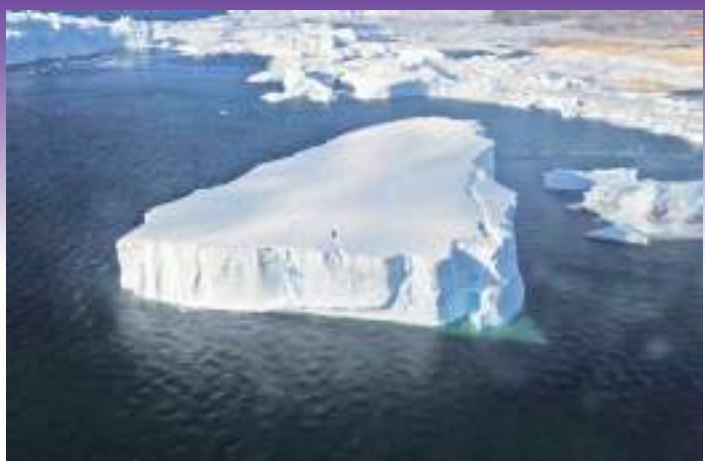
南极大陆的降雪渐渐积压成冰，经过长年累月，移动到冰川或冰盖末端，在大海边缘断裂，就形成了南极冰山。

新华社日内瓦7月10日电(记者王其冰)世界气象组织10日发布的全球海面温度显示，5月和6月的全球海面温度分别创历史同期新高，南极海冰面积也创下有卫星观测记录以来6月的历史新低。