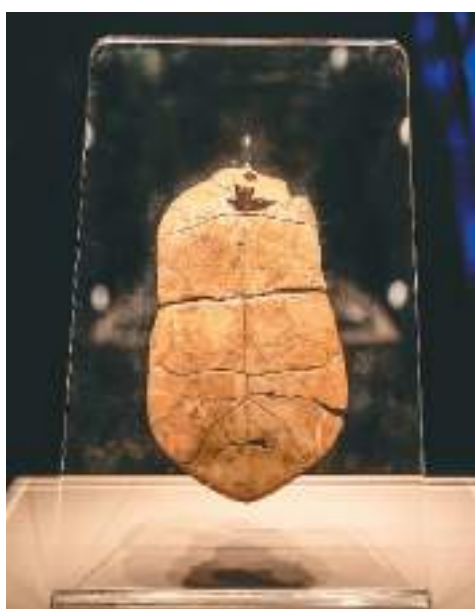
新石器时代贾湖遗址出土的刻符龟甲，河南博物院藏。

“看着这些古文字好感动！”“汉字文化源远流长，博大精深。”“从镌刻历史‘骨相’的殷商卜骨，到笔书民族气韵的淋漓翰墨，借由汉字，我们得以相识。”四川成都博物馆日前推出的“汉字中国——一方正之间的中华文明”特展人气火爆，观众好评如潮。开展至今，参观人数近40万，其中年轻人占比高达80%左右。