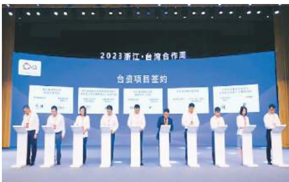
图为2023浙江·台湾合作周主场开幕式上的台资项目签约仪式。

本届合作周除在杭州举办主场活动外，还在宁波、温州、嘉兴等地举办分会场活动。来自海峡两岸的嘉宾、知名工商团体、行业协会、企业及台商青代表齐聚一堂，共话发展新格局，共商“两个先行”新机遇，共谱浙台融合新篇章。