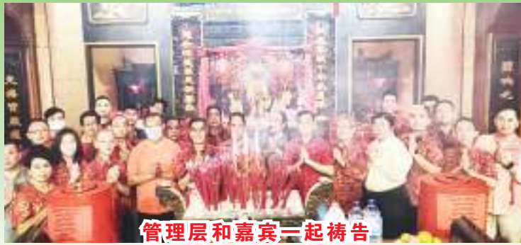
管理层和嘉宾一起祷告