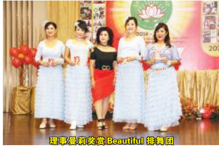
理事曼莉奖赏 Beautiful 排舞团