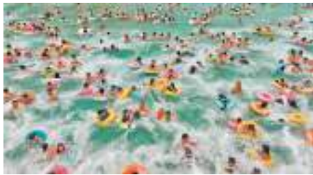
◆中國多地持續高溫，遊客在四川省遂寧市一旅遊度假區戲水消暑。

中國駐韓國大使館表示，感謝韓國民眾對旅韓大熊貓一家的呵護與喜愛，衷心祝願新誕生的兩隻熊貓寶寶健康成長，早日同公眾見面，為大家帶來更多歡樂，為增進中韓友誼繼續注入新的正能量。