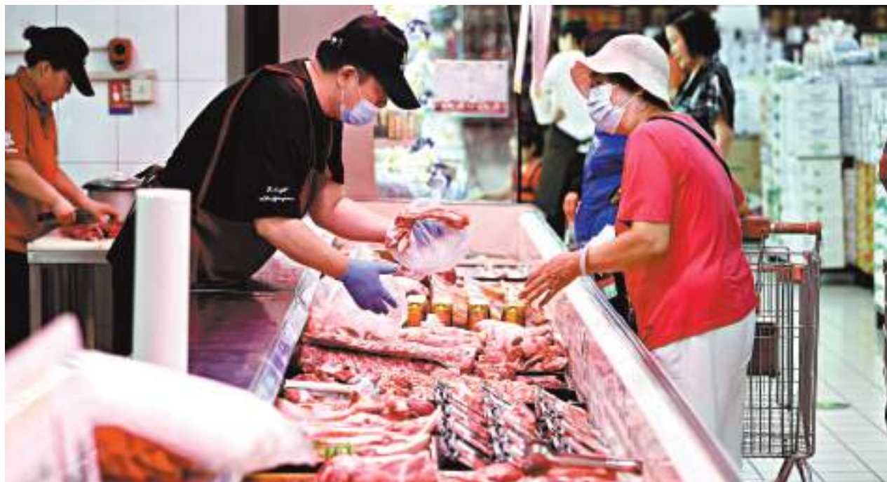
◆受豬肉價格、國際油價下行等影響，中國上月CPI、PPI同比表現雙雙低於預期。圖為消費者在山西太原一超市選購豬肉。

王軍建議，下一步宏觀政策還要鼓勵擴大汽車、家電、家居等大宗消費，從改善消費環境入手，大城市對汽車限購的政策有必要調整；要重視穩定房地產市場，穩定房地產投資，逐步取消和鬆綁需求端的一些限制性措施，特別是非一線城市的不必要的限購限售限價政策；要調動民營企業家的積極性，穩定民間投資。