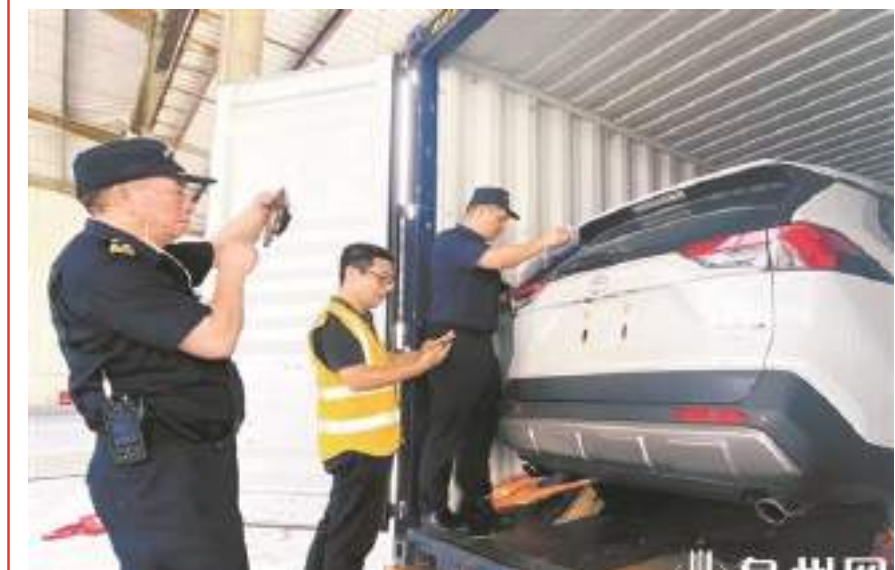
海關工作人員查驗出口二手車

泉州於2022年底獲準開展二手車出口業務。據了解,此次出口的39輛二手車,其中起亞牌轎車26輛,豐田牌轎車13輛,共裝載13個集裝箱。泉州海關在獲悉企業出口訴求後,第一時間理順流程,明確申報要點,採取提前申報、轉關無紙化等措施,實現貨物“即到、即查、即放、即轉”,採用“非侵入式機檢+人工查驗”方式,實現高效監管,全力保障二手車順利通關,助力外貿產業鏈和供應鏈穩定,助力外貿促穩提質。