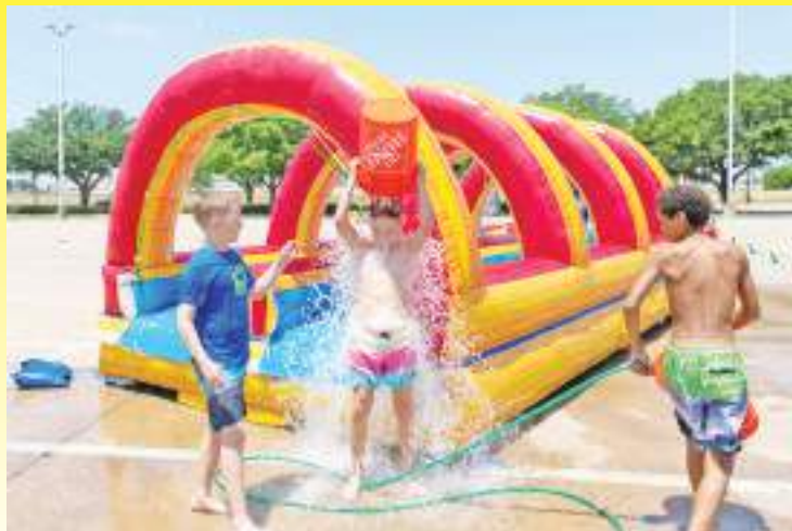
2023年6月27日，在美国得克萨斯州达拉斯市郊，儿童在玩水。近日，美国得克萨斯州迎来高温天气，达拉斯气温达到华氏115度(约合46摄氏度)。

新华社日内瓦7月5日电 世界气象组织4日宣布，热带太平洋七年来首次形成厄尔尼诺条件，这可能导致全球气温飙升、破坏性天气和气候模式