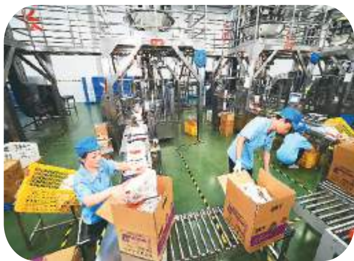
▲6月28日，湖南省岳阳市平江高新技术产业园，劲仔食品平江生产基地的员工将鳀鱼产品装箱。