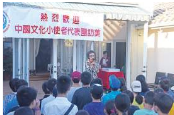
资料图为2017年7月29日,美国知名侨领张素久在洛杉矶欢迎来自北京的中学生参访团。

在我看来,民间交往归根结底就是交朋友,既可阳春白雪,也可下里巴人,方方面面都可成为连结民心的纽带。如,我身边有一些优秀的华人企业家朋友,他们的公司为当地提供了工作岗位,很多员工是土生土长的美国人。这些华人企业家将中华优秀传统文化和智慧融入公司管理和日常言行,经常给当地员工和合作伙伴讲中国故事,让他们了解中国。再如,洛杉矶的华侨华人社团经常在中国传统节日给当地的低收入者、无家可归者捐赠食物和生活物品;在疫情以及其他灾害发生时,华侨