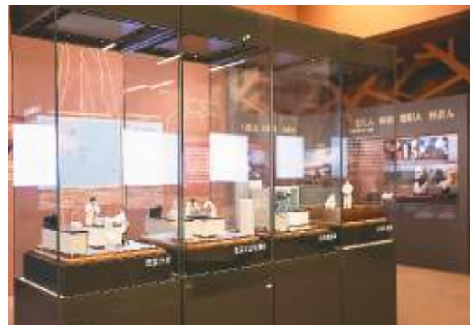
展览中展示的科研场景模型。

20世纪80年代以来，古DNA成为研究人类遗传与演化史的有力工具。展厅里有一组栩栩如生的微缩模型，让观众直观地了解研究人员如何从古生物样本中提取古DNA进行分析研究。