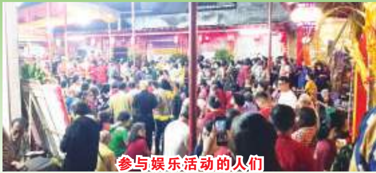
参与娱乐活动的人们