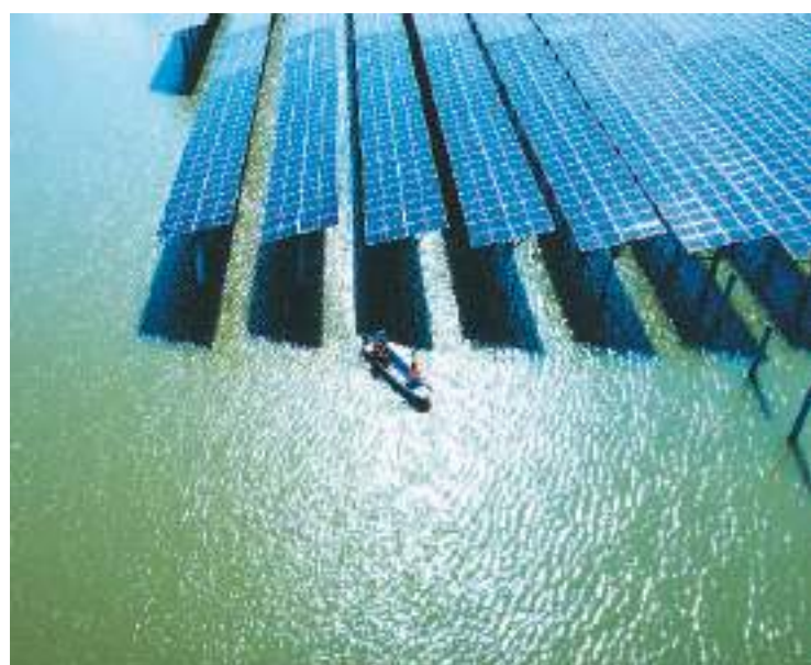
在广东省佛山市南海区镇海渔港涂600兆瓦渔业光伏项目现场,一望无际的光伏阵列蔚为壮观。目前,该项目实现全容量并网,为粤港澳大湾区高质量发展输送绿色新动能。图为南方电网广东江门台供电局工作人员乘船深入项目现场巡检。

报告预计,到2030年,伴随工业、建筑、交通等终端用能部门电能替代不断加强,中国电气化进程将由目前的电气化中期成长阶段,进入电气化中期转型阶段,带动电能占终端能源消费比重达到35%左右。同时,经济社会发展全面绿色转型取得显著成效,电力绿色供应水平进一步提升,非化石能源发电装机容量占比达到60%左右,非化石能源发电量占比接近50%,非化石发电量增量占全社会用电量增量比重达到90%左右。