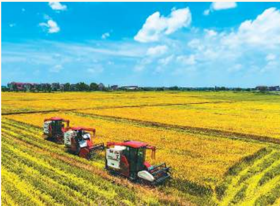
最近，江西省樟树市53万亩早稻陆续进入成熟期，当地农民抢抓农时开镰收割。图为樟树市永泰镇大观村村民趁着晴好天气抢收早稻，确保颗粒归仓。

“下一步，国家金融监督管理总局将持续推动适用个人所得税优惠政策的商业健康保险规范发展，引导人身保险行业不断提升专业能力，更好地满足多样化的健康保障需求，增强人民群众的获得感、幸福感和安全感。”国家金融监督管理总局有关部门负责人说。