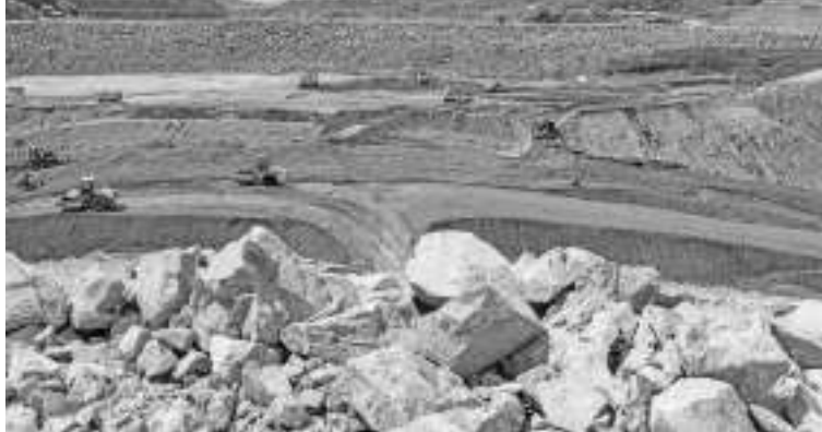
从Citanduy河流入Leuwikeris水库的储水量，每年能达到53亿立方米，并预定今年12月就能完成储水或初步填充过程。

正值新冠肺炎大流行减缓期间，世界面临供应链中断的现象，因为生产厂家不能满足市场需求量。