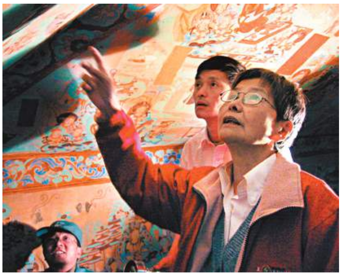
◆10日，敦煌研究院舉辦「樊錦詩星」命名、樊錦詩基金設立暨樊錦詩從事敦煌文物工作60年座談會。被譽為「敦煌女兒」的樊錦詩再向中國敦煌石窟保護研究基金會捐資1,000萬元。圖為樊錦詩在莫高窟第85窟壁畫修復現場檢查工作。

習近平總書記2019年在考察莫高窟並主持召開座談會時，當面勉勵她們再接再厲，努力把研究院建設成為世界文化遺產保護的典範和敦煌學研究的高地。「我認為，作為敦煌研究院的名譽院長，這也是對我個人的要求，所以我對敦煌的奉獻還要繼續，還要再盡綿薄之力。」樊錦詩說。