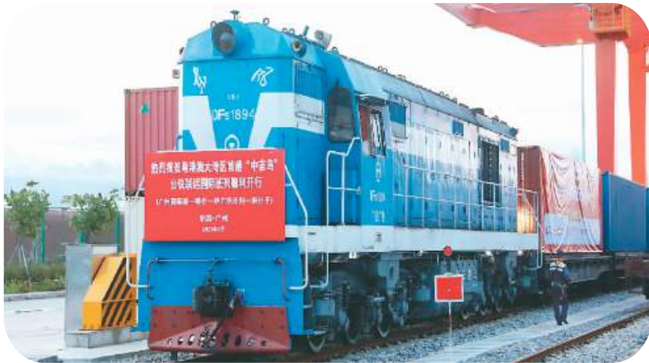
▲7月4日清晨，一列满载着家用电器、灯具、小家具等产品的中欧班列缓缓从广州国际港驶出，标志着从粤港澳大湾区始发的“中吉乌”公铁联运国际班列正式开通运营。广州海关就货物申报等业务提供24小时专线支持。

进出口物流畅通，贸易才能繁荣。6月12日，海关总署在自身职责范围内推出了持续提升跨境物流效率、促进重要农食产品进出口、进一步便利出口退税办理等优化营商环境16条举措（简称“16条”），进一步稳定社会预期，提振外贸发展信心。近一个月来，相关便利化通关举措在各地落实情况如何？给外贸企业带来哪些利好？为外贸发展积聚了哪些新动能？