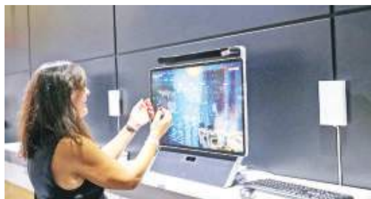
2021年6月29日，在西班牙巴塞罗那，观众在世界移动通信大会法国电信公司展厅体验5G技术的“低延迟”。

让-诺埃尔·巴罗说，除公共研究外，法国的产业生态必须动员起来，以便在6G标准制定中发挥关键作用。