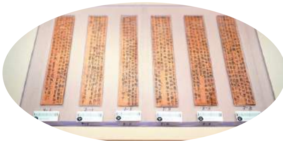
湖南省龙山县里耶古城遗址出土的秦代简牍，湖南省文物考古研究所藏。

“到了商代，汉字已走过漫长的‘童年时代’，形成了体系完备的甲骨文，这是迄今所知东亚地区最