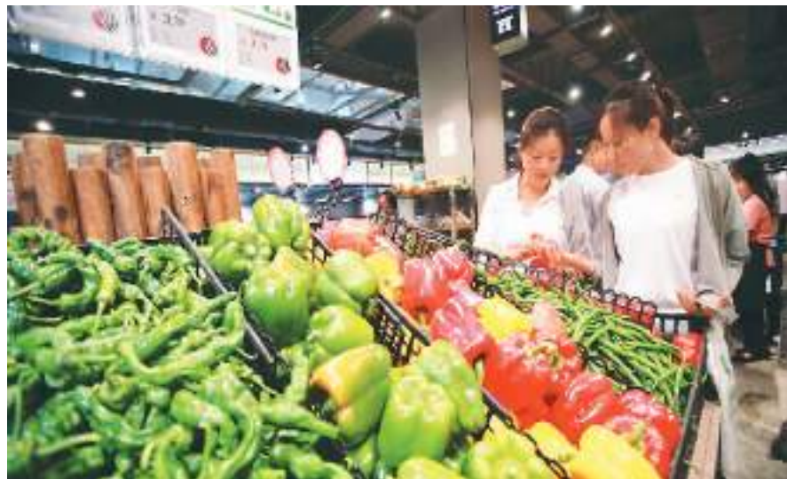
七月十日,消费者在山东省临沂市平邑县一家超市选购蔬菜。

“PPI下降,主要受石油、煤炭等大宗商品价格继续回落及上年同期对比基数较高等因素影响。”董莉娟说,从同比看,生产资料价格下降6.8%,降幅扩大0.9个百分点;生活资料价格下降