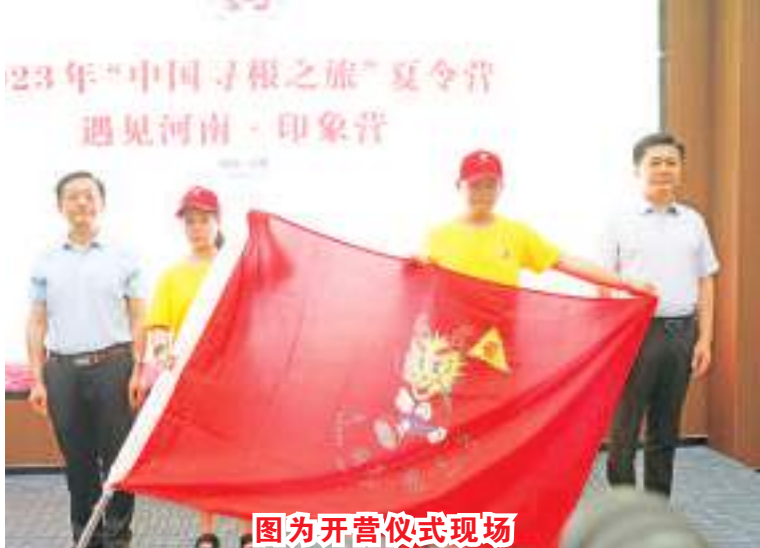
图为开营仪式现场

绍兴历史灿烂悠久,被誉为“东亚文化之都”,是海外华人了解中国的一扇窗口。绍兴市侨联相关负责人表示,在致辞中表示,如今的绍兴,既能“触摸”到延续千年的文脉,又能看见一座“亚运之城”的崭新活力,希望海外华裔青少年们有机会到绍兴实地探访,“零距离”领略绍兴的历史和今天。