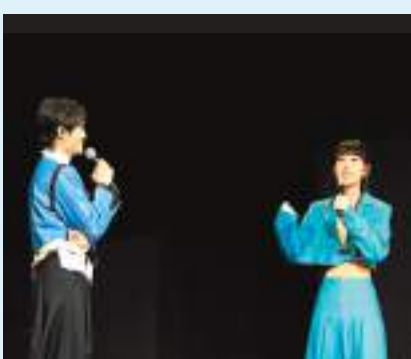
◆胡鴻鈞的廣州音樂會請來炎明熹擔任嘉賓。