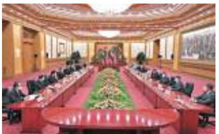
◆7月10日下午，中國國家主席習近平在北京人民大會堂會見俄羅斯聯邦委員會主席馬特維延科。

習近平指出，在雙方共同努力下，中俄關係始終保持健康穩定發展勢頭，各領域合作穩步推進，兩國世代友好的社會基礎和民意基礎更加牢固。今年3月，我對俄羅斯進行國事訪問，同普京總統就深化兩國全面戰略協作和各