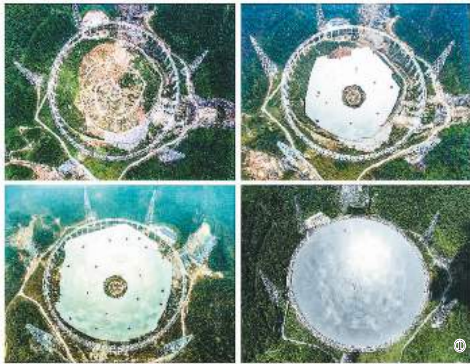
图①：这是一张拼版照片；依次为“中国天眼”拼装第一块反射面板（左上，2015年8月2日摄）、“中国天眼”反射面板安装近半（右上，2015年12月16日摄）、“中国天眼”反射面板安装近八成（左下，2016年3月9日摄）、维护保养期间的“中国天眼”（右下，2022年7月21日摄）。

“一个500米跨度的望远镜，控制精度却要达2毫米，到底怎么实现？”带着南仁东老师布置的课题，姜鹏反复琢磨，下决心做好这个没有先例的建设工程。