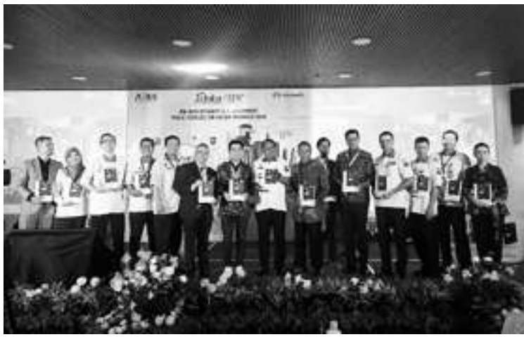
华为承诺支持我国行政管理数字化转型。

【本报讯】华为全力支持所有基于云数据治理和安全意识纳入一项发展政策。华为的承诺于2023年7月4日至6日举行的“2023年第三届印度尼西亚一数据和2023年eGov”网络峰会的实施中得到了肯定。 人协议长庞邦(Bambang Soesatyo)表示,印度尼西亚一数据网络峰会的主题提醒我们,建立一个有竞争力的经济,对于实现印度尼西亚到2045年成为世界第五大国民生产总值国家的预测非常重要。提升竞争力的重要因素之一是通过优化数字化转型。数据集和成和基于电子的政府系统将发挥非常重要的作用。我们感谢华为和大数据和人工智能协会(ABDI)等那些坚定承诺继续提高公众素养和对基于云数据治理和安全重要性的认识的公司。