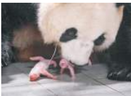
▲▲這是7月7日在位於韓國京畿道龍仁市的愛寶樂園裏拍攝的大熊貓媽媽「愛寶（華妮）」和剛誕生的大熊貓寶寶。