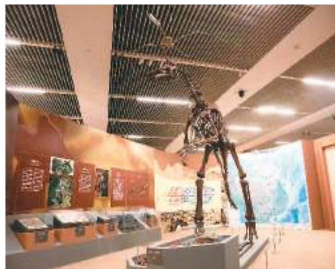
“东方故乡——中华大地百万年人类史”展览第一展厅。

我们是谁？我们从哪里来？这是人类持续探索的问题。近日，“东方故乡——中华大地百万年人类史”展览在中国国家博物馆开幕。展览依托中国科学院古脊椎动物与古人类研究所和中国国家博物馆的丰富馆藏，通过220余件（组）文物和多媒体展示手段，生动展现近百年来中国在古人类学、旧石器考古学和古DNA研究等方面的成果，全面讲述从猿到人的百万年演进历程，系统阐释源远流长的文化根脉。