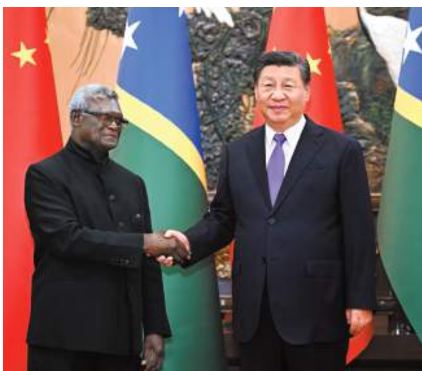
◆7月10日下午，中國國家主席習近平在北京人民大會堂會見來華進行正式訪問的所羅門群島總理索加瓦雷。

索加瓦雷表示，同中國建交是所方作出的正確選擇。建交以來，兩國關係取得繁榮碩果。中國已經成為所羅門群島最大基礎設施合作夥伴和可信賴的發展夥伴。習近平主席提出全球發展倡議、全球安全倡議和全球文明倡議，展