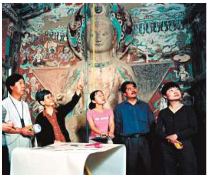
◆2004年樊錦詩指導青年研究工作。