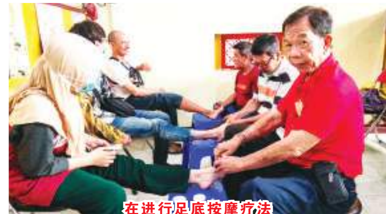
在进行足底按摩疗法