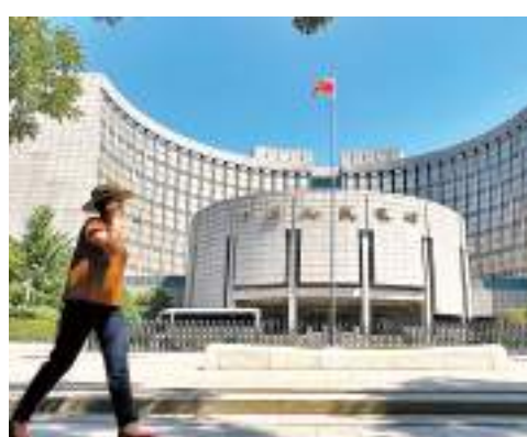
◆人行等機構對金融支持房地產市場平穩健康發展有關政策期限延至明年12月31日。資料圖片

香港文匯報訊（實習記者 梁逸熙）中國人民銀行（人行）、國家金融監督管理總局10日宣布，延長金融支持房地產市場平穩健康發展有關政策期限。《中國人民銀行中國銀行保險監督管理委員會關於做好當前金融支持房地產市場平穩健康發展工作的通知》（下稱《通知》）有關政策的適用期限，將統一延長至明年12月31日。