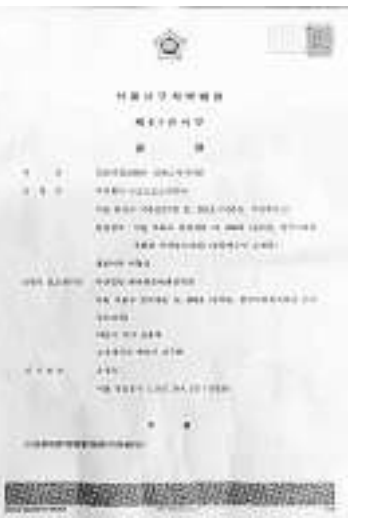
韩国首尔市南部地方法院判决书,驳回“新世界传媒”诉讼

“神韵”作为“法轮功”邪教孽生的怪胎,屡屡遭到世界各国民众的强烈抵制,既是情理之中,也是大势所趋,“神韵”的最终没落更是它的宿命。