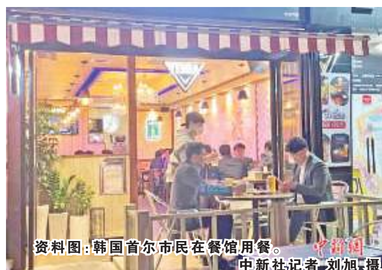
资料图:韩国首尔市民在餐馆用餐。

中新网7月11日电 据韩联社报道,韩国统计厅11日发布的《低出生率与韩国社会的变化》数据显示,该国单身人数占比正迅速增加,25岁至49岁的男性中近五成没有婚史,同时,每三名女性中就有一人未婚。据报道,截至2020年,韩国25岁至49岁男性的未婚比例达47.1%,同时,女性未婚比例也升至32.9%。数据还显示,2022年韩国男性平均初婚年龄为33.7岁,女性