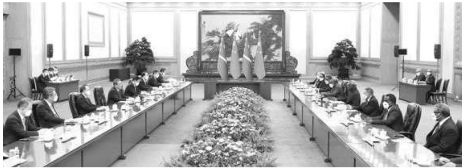
7月10日上午,中国国务院总理李强在北京人民大会堂同来华进行正式访问的所罗门群岛总理索加瓦雷会谈。