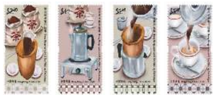
“非物质文化遗产——港式奶茶制作技艺”特别邮票。

本报香港7月10日电(记者陈然)香港邮政10日宣布，将于本月25日发售以“非物质文化遗产——港式奶茶制作技艺”为题的特别邮票及相关邮品。