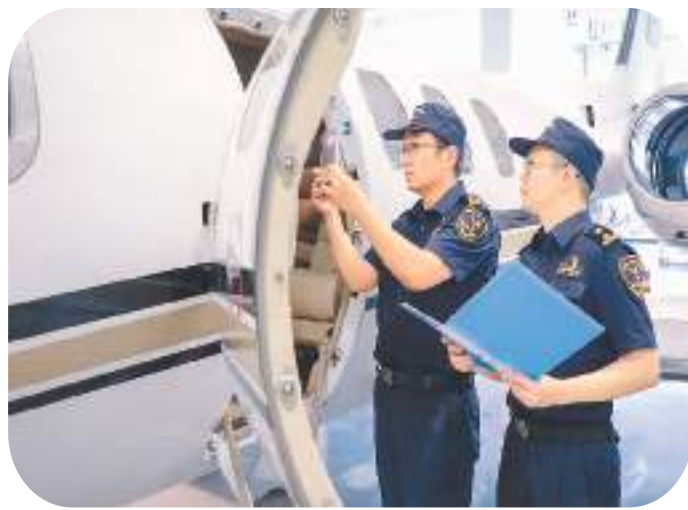
▲不久前，乌鲁木齐海关所属乌鲁木齐海关关员正在对辖区企业进口的教学展示用飞机进行现场查验。