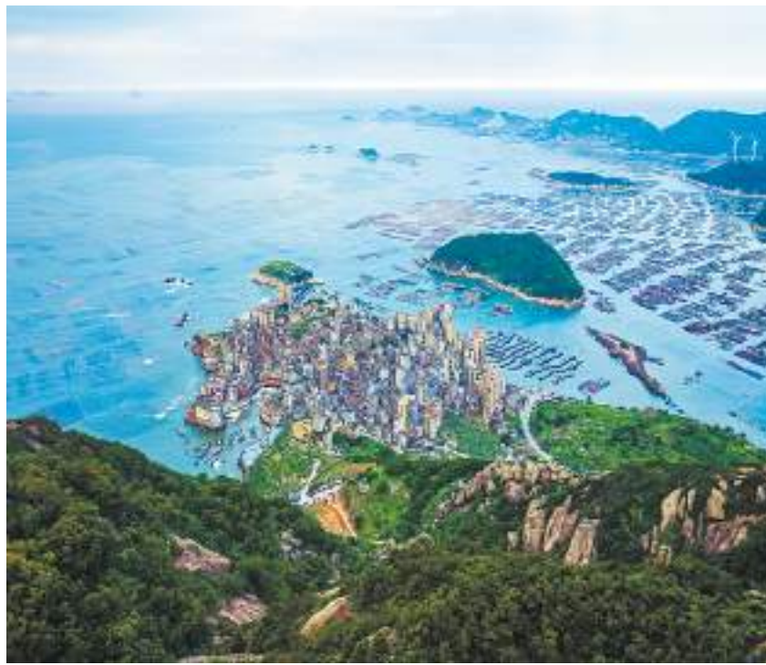
十大网红打卡点之一的旗冠顶。

据了解,环马祖澳滨海旅游度假区总规划面积约13平方千米,海岸线长约45千米,围绕“山海度假梦、两岸家国情、闽式生活颂”三大主题海岸,打造具有海峡文化特色的国家级滨海旅游度假区。下一步,连江将进一步用好滨海旅游资源,加快推动滨海旅游品牌走出连江、走向全国、走向世界。(郑瑞洋)