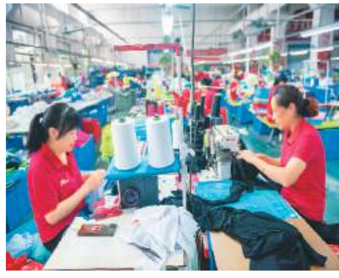
湖南省娄底市通过打造一批专精特新“小巨人”企业,激发企业创新创造活力,促进中小企业在特色发展之路上成长,助力实体经济高质量发展。图为日前,娄底市专精特新“小巨人”企业、湖南省专精特新中小企业湖南茵浪体育股份有限公司员工在生产车间内制作球衣。

近年来,安徽持续发挥投资对稳定经济的关键作用,推动投资结构不断优化。今年1—5月份,安徽工业投资增长21.8%,高于全国13个百分点。其中制造业投资增长18.9%,高于全国12.9个百分点,占全部投资比重提高到30.8%。