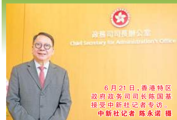
6月21日，香港特区政府政务司司长陈国基接受中新社记者专访。

中新社香港6月23日电 中新社记者曾平 新一届香港特区政府约半年前推出全新的“高才通计划”，以过往罕见的力度争取全球人才来港发展。“我们这么多年来，没试过有那么多人都希望来香港工作、来香港定居。”特区政府政务司司长陈国基近日接受中新社记者专访时说，“抢人才”取得的成绩远超预期，同时香港也采取行动“留人才”。