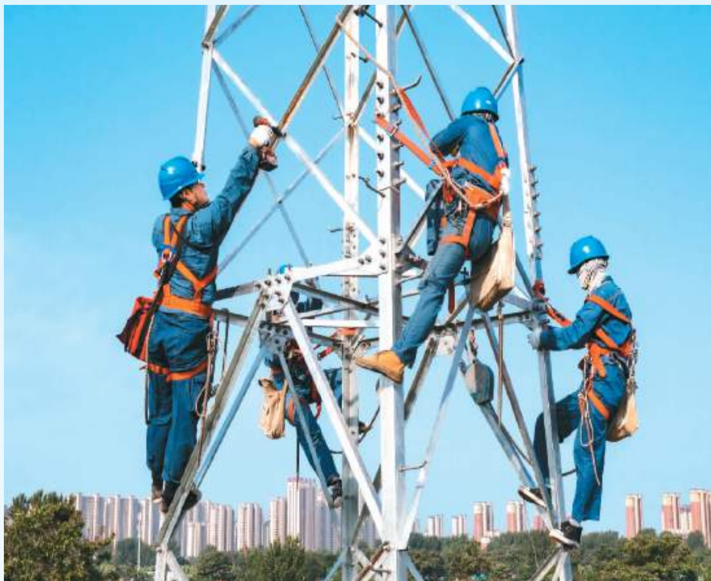
▲安徽省亳州市谯城区汤陵社区，电力施工人员正在吊立角钢塔。

目前，全国多地陆续进入夏季高温季节。炎炎烈日下，许多劳动者顶热浪、战高温，奋战在户外一线，用汗水和奉献诠释爱岗敬业精神。