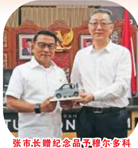
张市长赠纪念品予穆尔多科