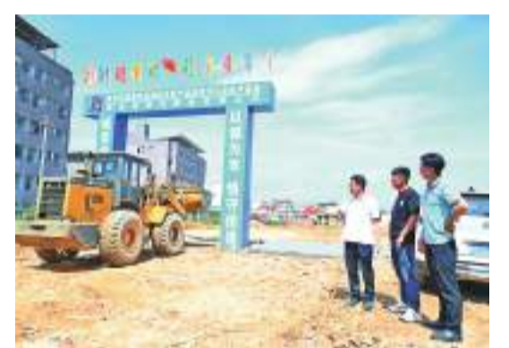
圖為仙游縣發改局工作人員到項目現場指導服務。