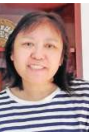
作者简介: 如玉, 记者出身, 曾供职于报刊及出版社, 资深媒体人, 以写深度报道、纪实通讯、人物传记见长。

作者简介: 李双, 生于贵阳, 后居成都, 现居墨尔本。曾任报社编辑、记者。世界华文作家协会会员, 澳大利亚新州华文作家协会会员。著有长篇小说四部, 短篇小说40余篇及随笔2000余篇。