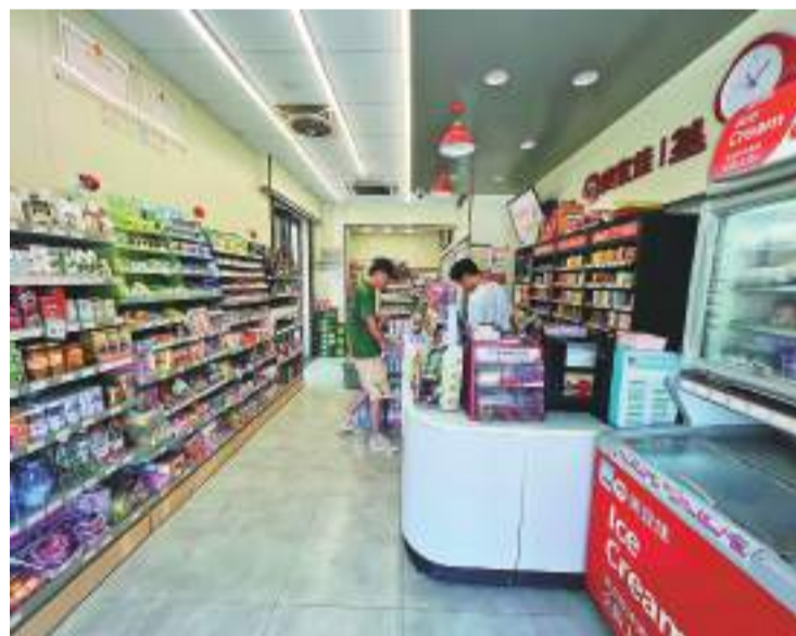
圖為上塘社區裏的24小時便利店。