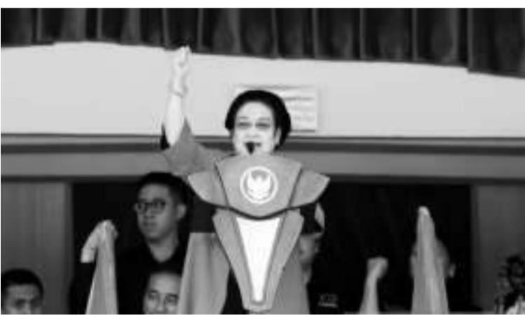
印尼斗争民主党主席梅加瓦蒂。

【本报讯】6月24日，在雅加达史耐廷的翁加诺体育馆举行的“苏加诺月”高峰论坛时，印尼斗争民主