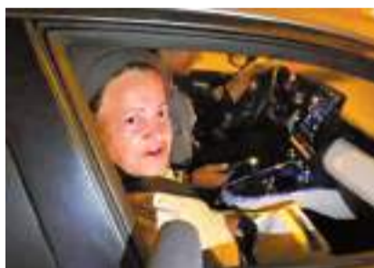
◆納蒂亞指暴徒藉奈爾被殺一事四處破壞，網上圖片

除了不信任警察，熱點地區的貧窮與資源缺乏也是結構性問題。特龍認為，走出危機的方法之一，是警察改善對待郊區居民的態度，要能區分罪犯與一般居民，遵守法治，並提供公眾服務，不應把所有郊區青年都視為潛在罪犯。