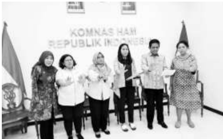
六个合作促进预防虐待机构呼吁政府制定预防虐待机制。行为。这个推动行为还与日纪念活动有关。我国自1988年以来，每年6月26日举行的国际禁止虐待活动的国际承诺。(亮剑)

加强防止虐待的国家机制，同时确认我国对实现宪法权利的承诺。此外，免受虐待是一项在任何情况下都不能削弱的权利。合作促进预防虐待机构还提醒政府定期报告自2012年以来一直推迟的禁止虐待、处罚和其他残忍或不人道待遇公约的执行情况。 合作促进预防虐待机构还对各机构为防止虐待行为为再次发生而采取的公开和透明举措表示赞赏。合作促进预防虐待机构还鼓励民间社会采取行动制止在社区发生的虐待