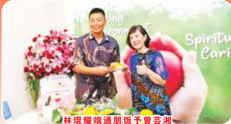
林琨耀端通朋饭予曾芸湘