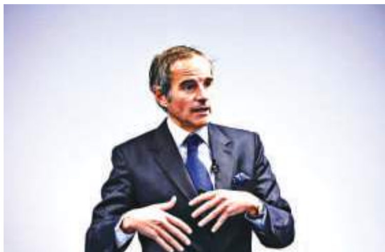
资料图:国际原子能机构总干事格罗西。

据报道,此前,IAEA调查团已对福岛核污染水排海问题进行了多次调查,并制作了关于核污染水入海安全性的调查报告。报道称,格罗西计划