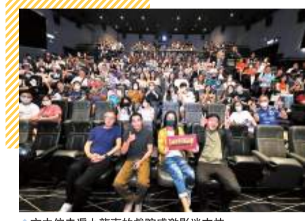
方中信走遍九龍東的戲院感激影迷支持。