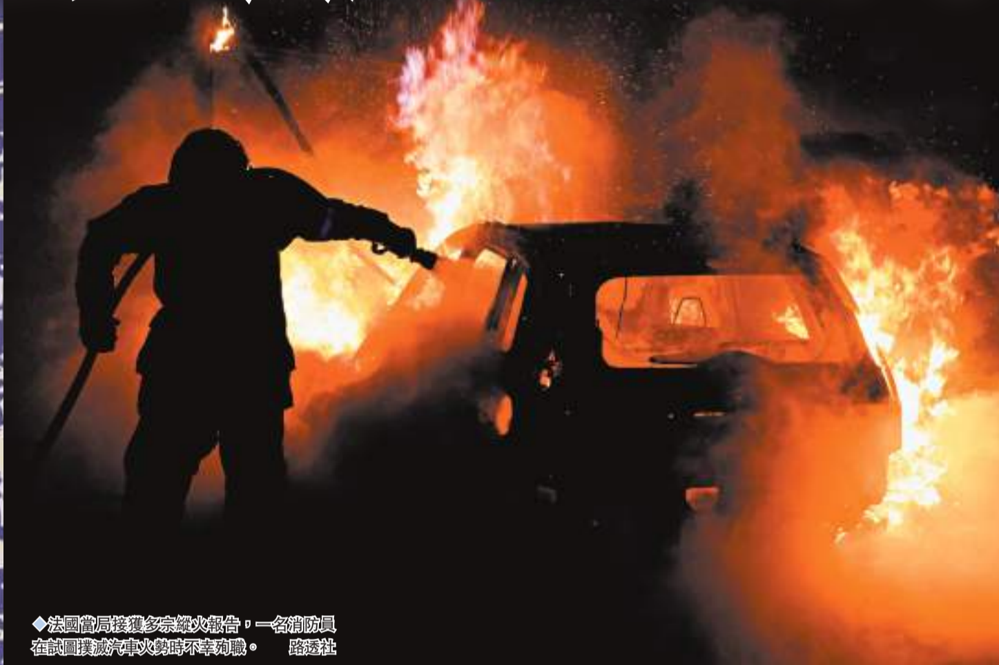
◆法國當局接獲多宗縱火報告，一名消防員在試圖撲滅汽車火勢時不幸殉職。

香港文匯報訊 法國非裔少年遭警員射殺，在全國引發的騷亂2日踏入第六晚，當局表示接獲352宗縱火報告，一名消防員在試圖撲滅汽車火勢時不幸殉職。網上流傳的片段顯示，有民眾持刀守護個人財物，避免遭暴徒破壞。