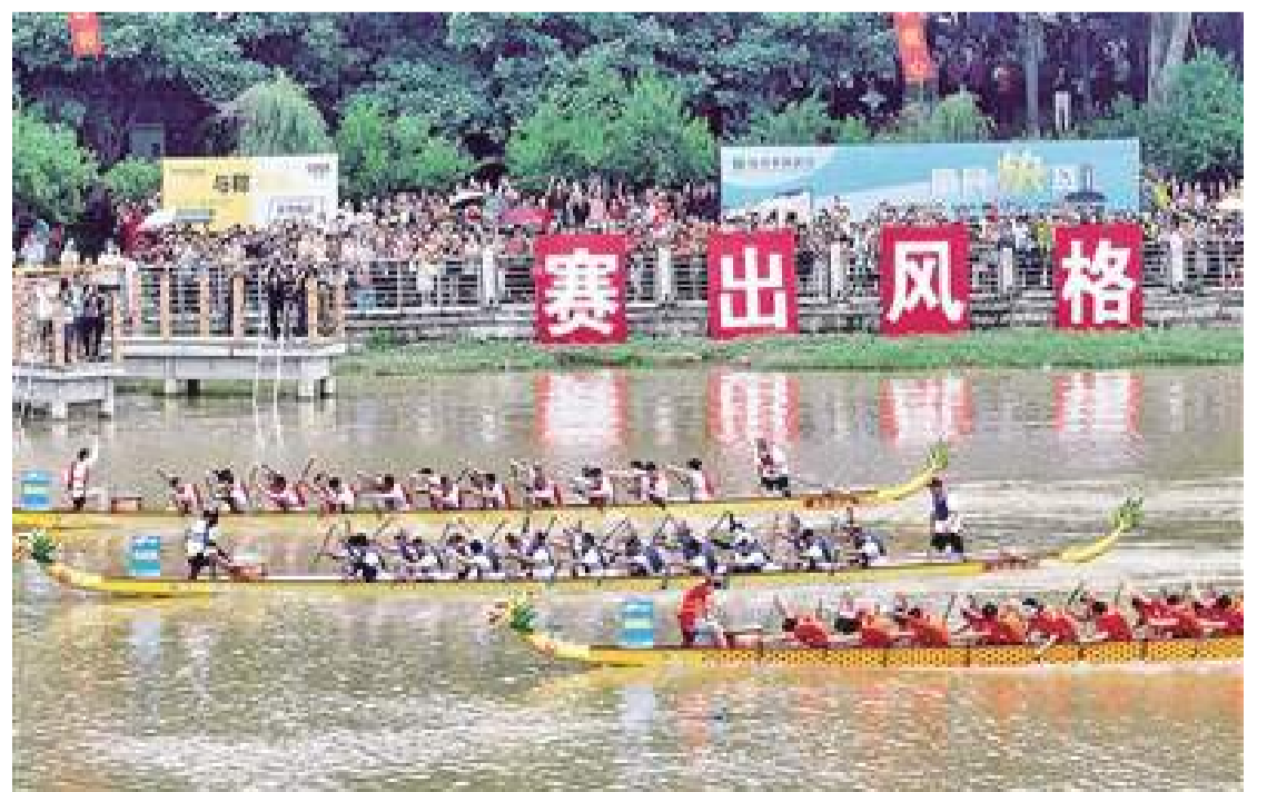
圖為龍舟比賽現場。