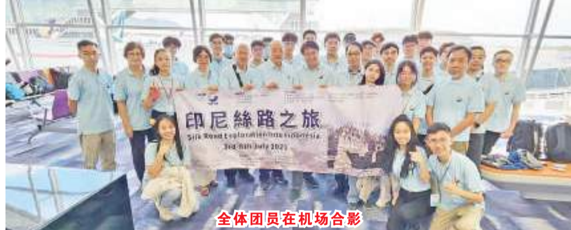
全体团员在机场合影