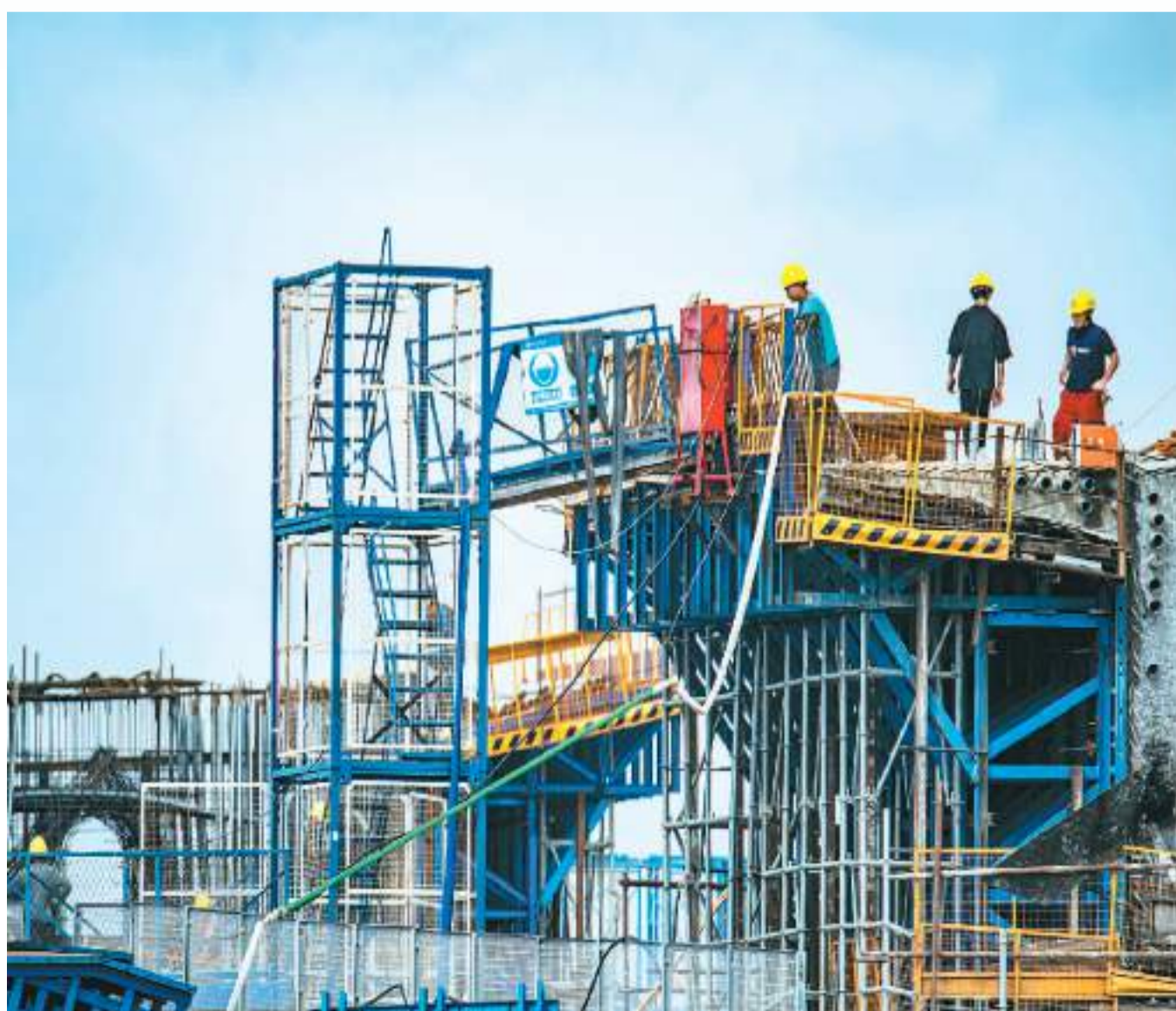
▲海南省琼海市G9812高速公路延长线工程项目工地，施工队员冒着高温烈日紧张施工。