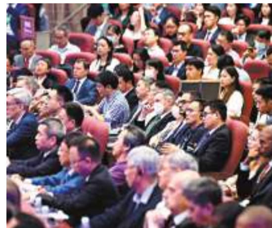
7月2日，第十一屆世界和平論壇在北京清華大學開幕。 中新社