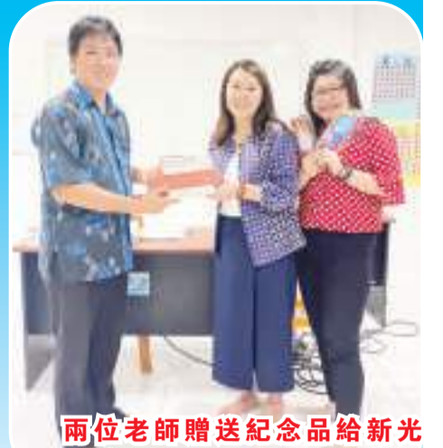
兩位老師贈送紀念品給新光明印華學校

【本報訊】2023年6月28日至7月1日的“台湾侨务委员会”在印尼山口洋新光明印華學校舉辦的華文教師研習會已圓滿結束。在這為期4天的活動裡，老師們獲益良多。兩位老師認真傳授學員們知識，也希望讓學員們重新當一次學生，親自感受當學生的感受與體驗。研習中學員們沉浸在學習的氣氛中，重新體會了學生是如何學習華文，會遇到什麼樣的疑惑與困難，以及找出自己教學的優點與盲點，親身體驗有效的教學方式是如何影響學生成功地學習華文。