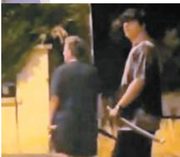
◆一批青年在梅斯住宅區手持日本武士刀巡邏，避免房屋和汽車遭暴徒砸毀。網上圖片

這宗襲擊事件引起公憤，法國市長協會發表聲明，指出法國各地行政區均發生嚴重騷亂，以極端暴力的方式攻擊國家象徵，並罕有地呼籲全國各地的公民和民選官員在市議會舉行「反騷亂集會」，表達反暴力立場，以恢復國家秩序。