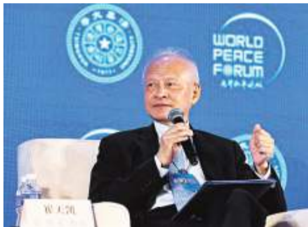
7月3日，崔天凱在第十一屆世界和平論壇上談中美關係。

「但我也注意到，布林肯訪華後回到美國，說美國還會繼續說中國不喜歡聽的話，繼續做中國不喜歡的事情。」崔天凱直言，「其實我們從來沒有指望美國說的話、做的事情會讓中國喜歡，我們也從來沒有承諾過，我們會說美國喜歡聽的話，會做美國喜歡看到的事情。」「我覺得關鍵在於雙方要找到一個相互尊重的辦法來處理雙邊關係，真正在相互尊重的基礎上實現和平共處、合作共贏，這不是誰要讓誰喜歡的問題。」