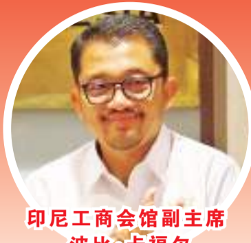
印尼工商会馆副主席波比·卡福尔