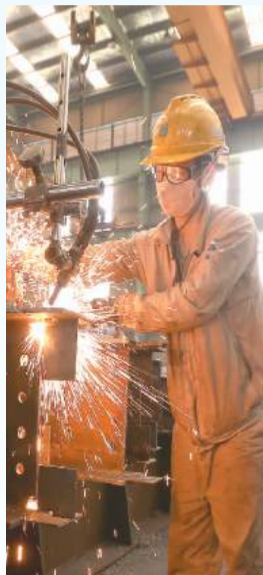
▲四川省眉山市，工人们正冒着高温赶制一批钢结构零部件。