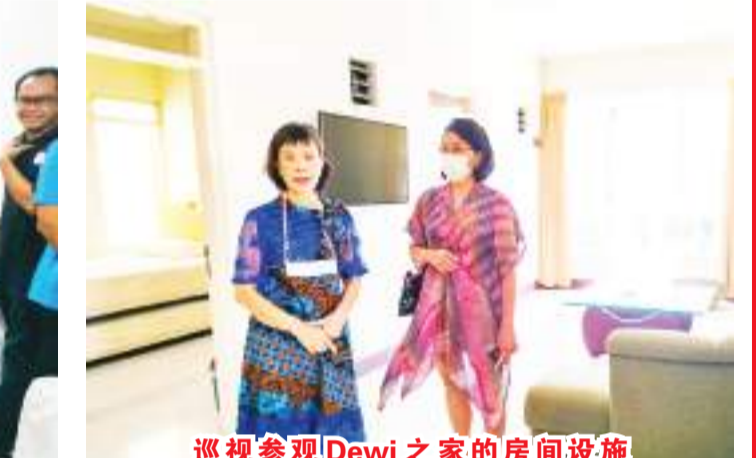
巡视参观Dewi之家的房间设施