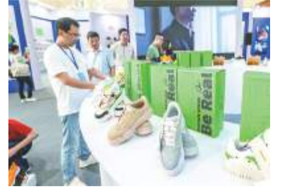
圖為莆田鞋自主品牌展示區現場。