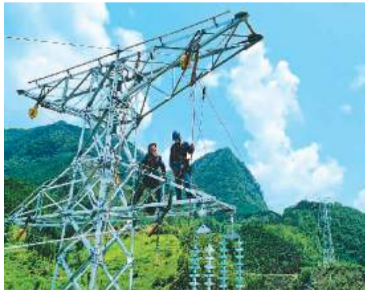
夏至以来,贵州省黔东南苗族侗族自治州兴义市遭遇持续高温天气,社会和工业用电负荷不断攀升。南方电网兴义供电局供电部门通过对220千伏、110千伏输电线路进行升级改造,优化电网结构,做好迎峰度夏保电供电工作。图为该局建设施工人员在输电线路铁塔上安装附件设备。

“总体看,工业企业利润延续恢复态势,但也要看到,外部环境更趋复杂严峻,国内需求仍显不足,制约企业利润进一步恢复,工业企业效益恢复的基础仍不牢固。”孙晓说,下一阶段,要落实落细推动经济持续回升向好各项政策措施,着力扩大有效需求,提高产销衔接水平,深入实施创新驱动发展战略,不断增强发展动能,推动工业经济持续巩固回升。