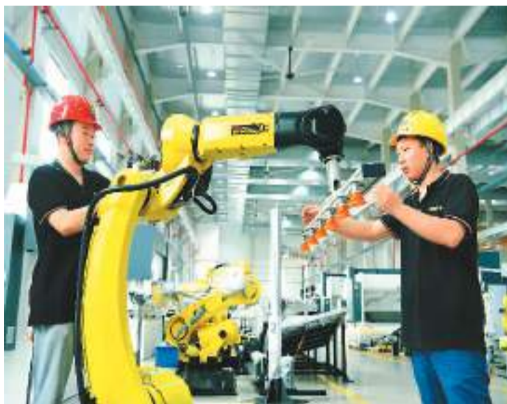
7月3日,在江苏省太仓市城厢镇瑞铁机床(苏州)股份有限公司,生产技术人员正在装配销往市场的工业机器人。

工业和信息化部表示,要进一步加强部门协同和部省联动,强化政策支持,营造良好环境。《意见》明确要落实企业可靠性技术研究、产品设计开发、中试阶段测试验证等环节研发费用加计扣除等普惠性政策,加大对可靠性提升的支持激励力度。