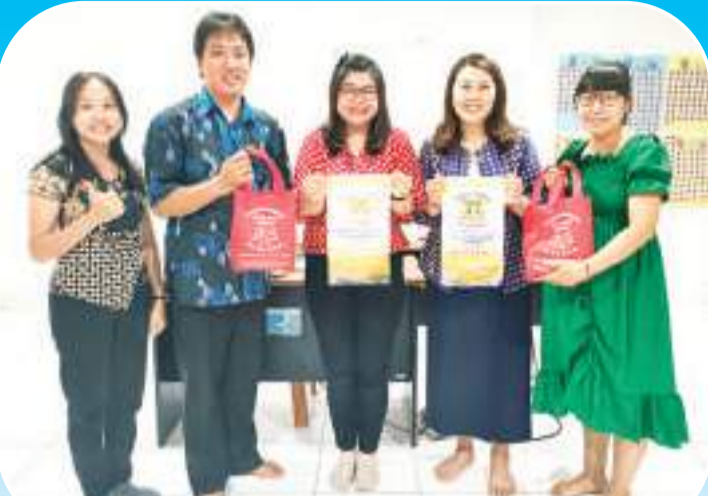
新光明印華學校代表全體學員贈送禮品給兩位老師