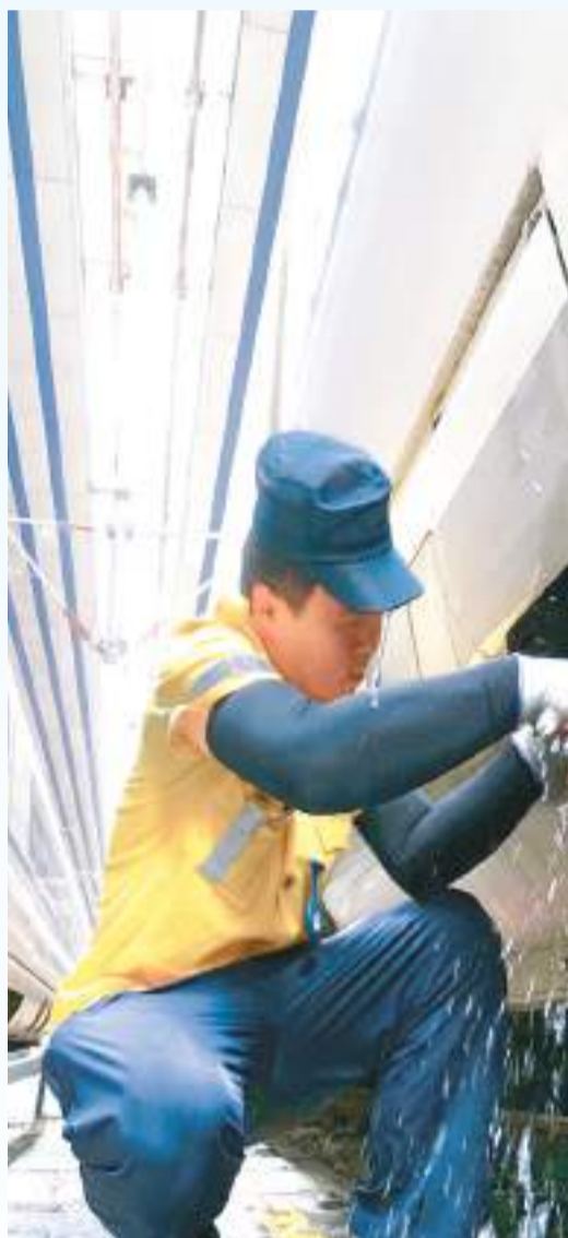
▲北京西站，供水车间的工人在高温中为进出站的列车加水。