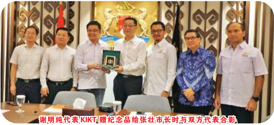
谢明纯代表KIKT赠纪念品给张壮市长时与双方代表合影

市，已经有18年的友好交流历史。张壮市长对印尼工商会座谈会和7月5日在雅加达举办的“最美柳州，走进印尼，柳州重点产业推介会”的支持表示感谢。 会上，张壮市长还向印尼朋友介绍了柳州市的社会和经济发展情况。张壮市长介绍道，柳州是以汽车、钢铁、工程机械和轻工为代表的传统工业基础扎实，以新能源、智能家电、智能电网、生物医药等新兴产业发展蓬勃。柳州交通非常便捷，是中国综合交通枢纽城市，铁路、公路和航空四通八达，柳州的水运可以通江达海，现在从柳州出发到雅加达的海铁联运已经通达，是中国距离东盟最近的工业城市，与印尼合作潜力巨大。 柳州同时也是一个文化旅游城市，生态名城。柳江水质连续三年在中国排在第一位。据介绍，柳州是国家园林城市，森林绿