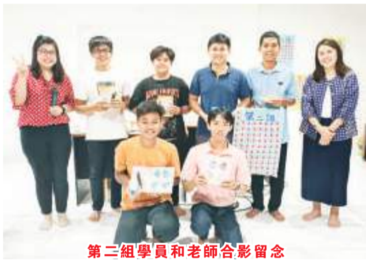
第二組學員和老師合影留念