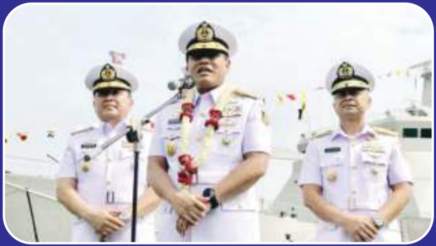
海上军事司令部成立62周年纪念会 7月3日,海军参谋长阿里上将(中)在雅加达主持海上军事司令部成立62周年纪念会时说,海军将在近日增加两艘扫雷艇。