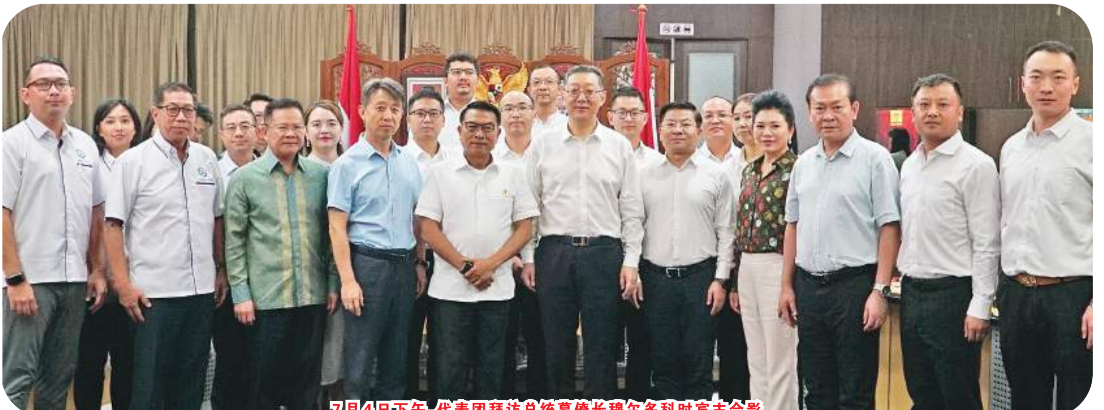
7月4日下午，代表团拜访总统幕僚长穆尔多科时宾主合影