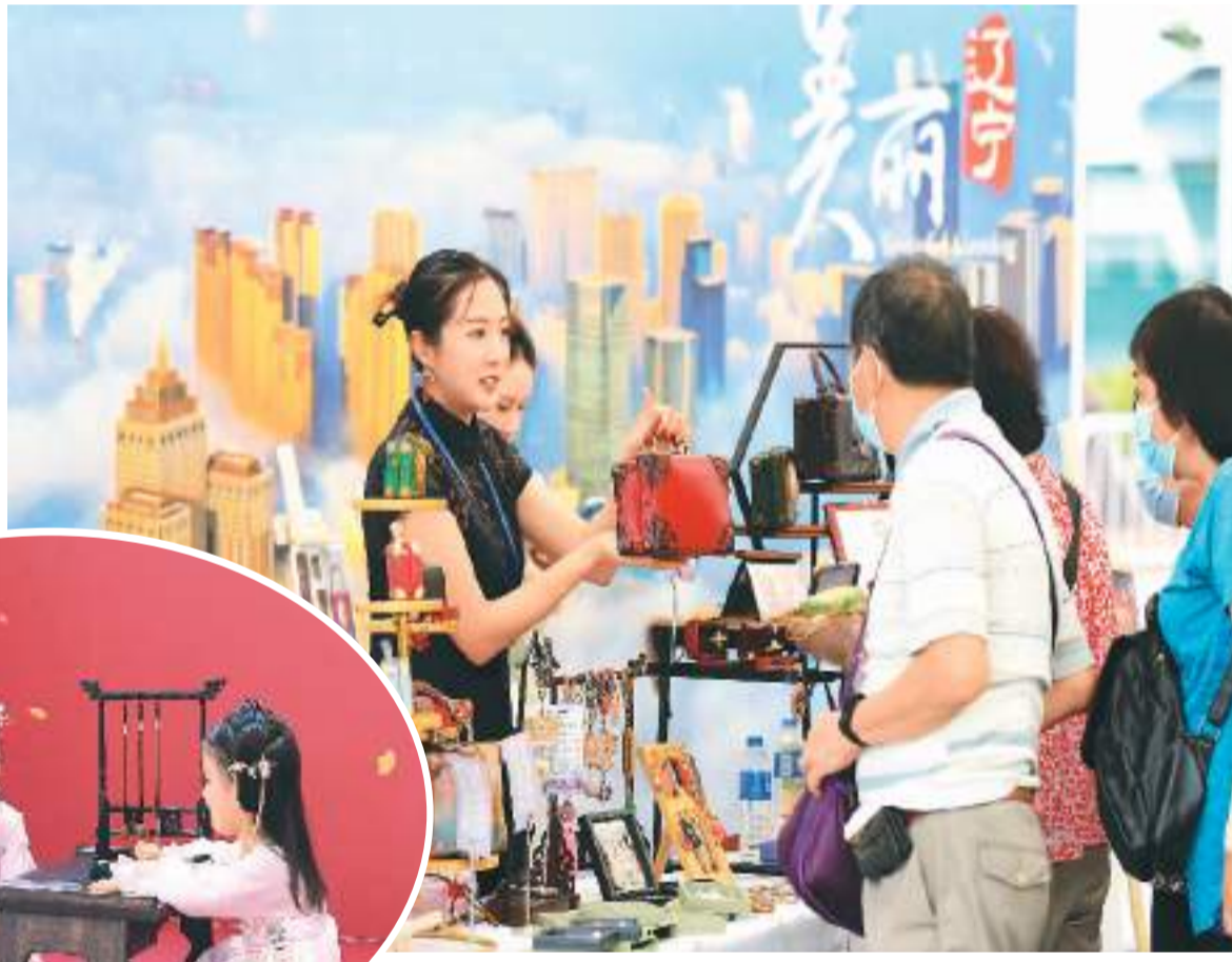
上图：在辽宁展区内，工作人员向市民讲解展品。

为庆祝香港回归祖国26周年，香港各界庆典委员会近日举行“维园庆回归”活动。庆委会邀请陕西省、辽宁省、山东省代表以及粤港澳大湾区多家科创企业，到维多利亚公园举办展览和表演。