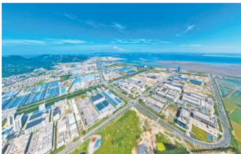
中印尼“两国双园”中方园区。

园区还联合海外福清籍社团“走出去”，在东盟国家搭建合作贸易平台，推动生成涉及印尼鱼糜、海