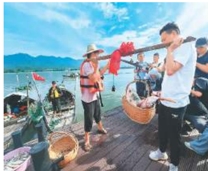
7月3日,富春江开渔节在浙江省杭州市富阳区场口镇东梓关村的码头举行,当地渔民满载鱼获返回东梓关码头,喜迎开渔后首场丰收。为有效保护鱼类产卵、苗鱼及幼鱼生长,促进鱼类资源的自然补充和水域生态环境的自我修复,浙江钱塘江流域每年3月1日至6月30日实施禁渔。图为渔民上岸称量鱼获。