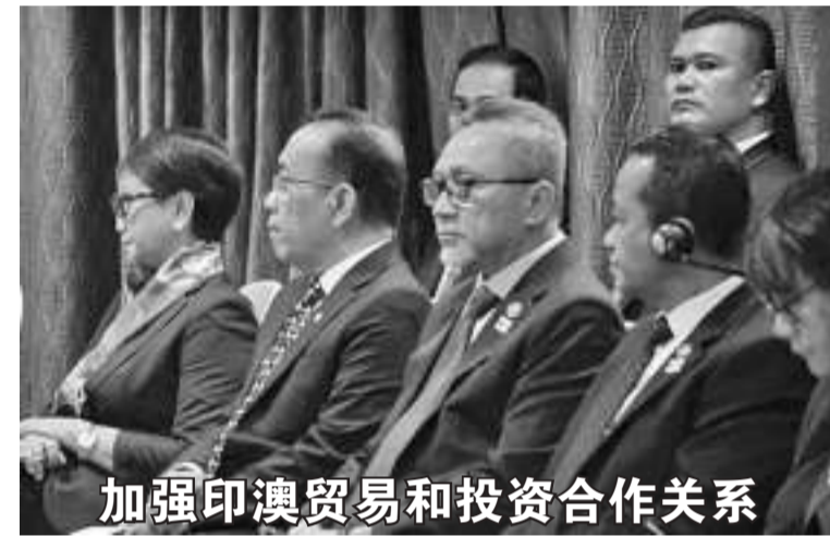
加强印澳贸易和投资合作关系

上述网站于6月30日(周五)的书面声明中表示：“如有需要，问题可以在包容和透明的国家特殊框架下通过联合特遣队处理。”