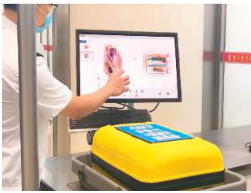
▲在海口美兰国际机场T2航站楼压力测试现场，工作人员展示行李查验系统。