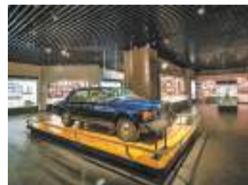
福清侨乡博物馆一个历史物件见证海丝贸易往来的繁盛。

人毅力打拼，形成一个庞大的近代海外融商群体，如：林绍良、林文镜、蔡道平、林逢生、郑年锦、纪辉琦等融商巨子，在水泥、面粉、食品、烟草、纺织、煤炭等行业均获得瞩目成就。