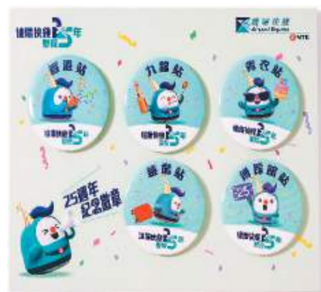
为庆祝机场快线通车二十五周年，港铁特别制作了一套五枚纪念徽章。