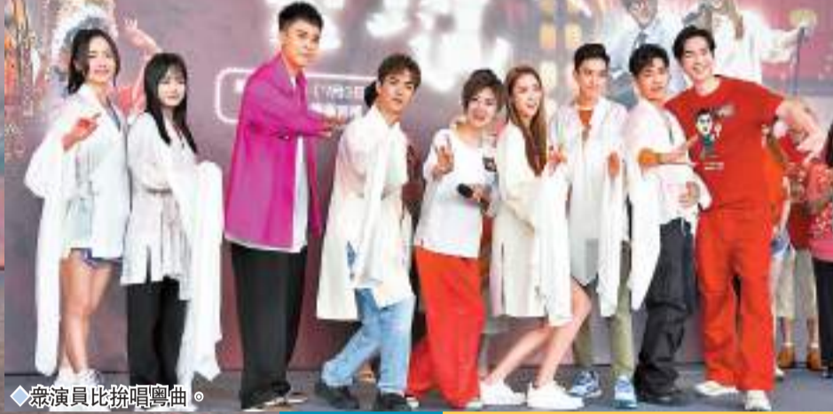
眾演員比拚唱粵曲。