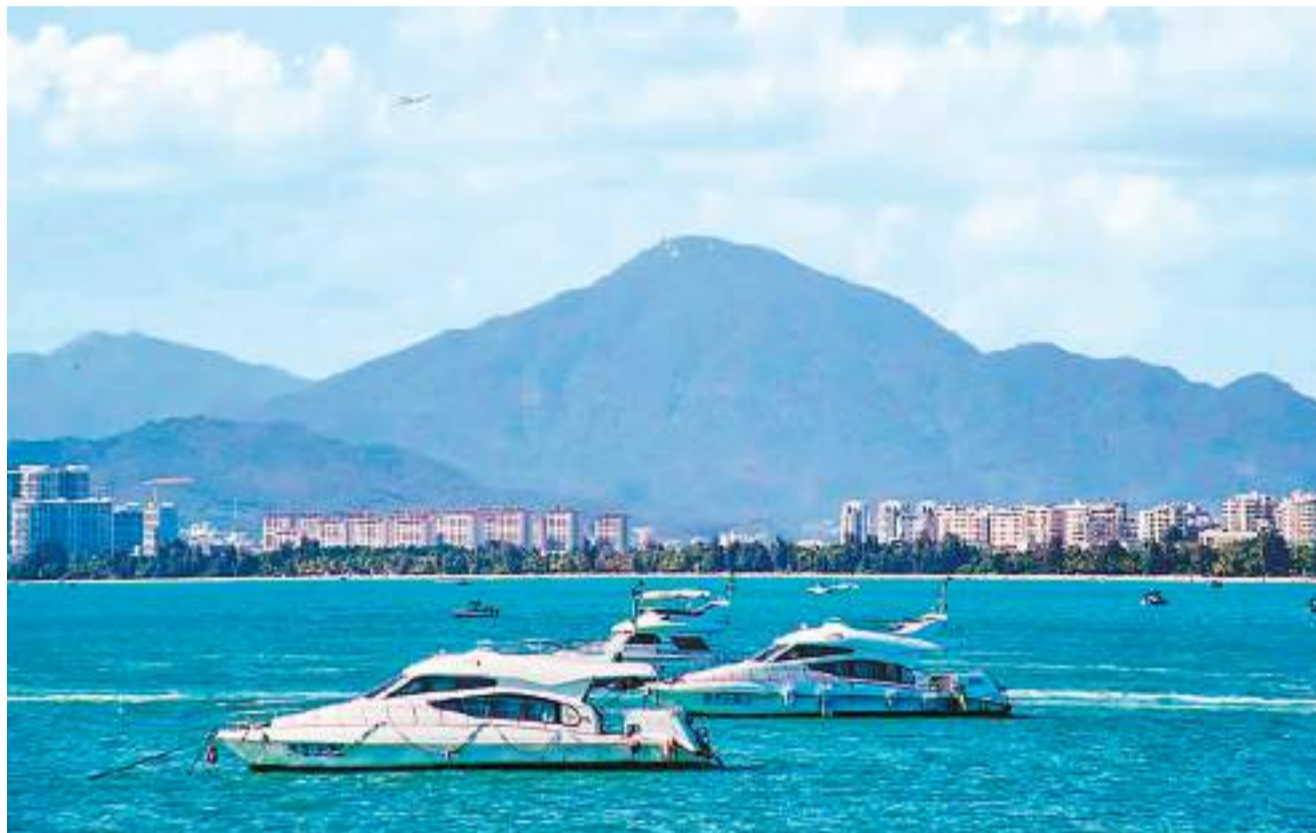
▲游艇产业是三亚的特色产业。图为行驶中的游艇。

外商投资准入负面清单缩减至27项，为全国最短；跨境服务贸易在全国首次以负面清单形式实施准入管理……海南速度、海南效率、海南服务，正吸引越来越多外商来琼投资。数据显示，今年前5个月，海南实际使用外资金额124.8亿元，同比增长35.4%，新设立外商投资企业562家。