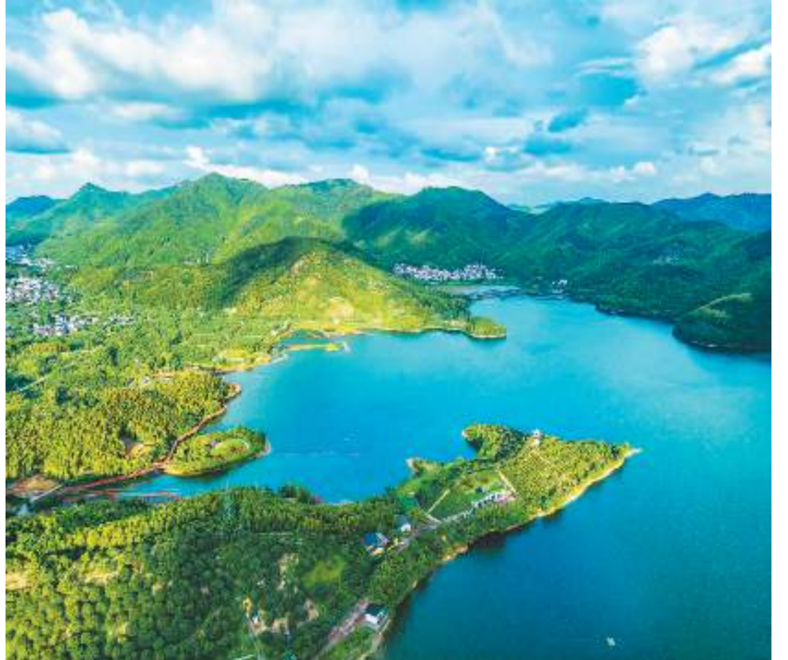
浙江省宁波市江北区慈城镇南联村充分发挥三面环山、一面临水的自然环境优势，发展乡村休闲旅游，依山傍水建设观景休闲平台、健身绿道、山地车越野公园等，增加了村民收入，助力乡村振兴。图为7月26日，山清水秀的南联村。

本报北京7月27日电 (记者刘诗瑶) 北京时间2023年7月27日4时02分，我国在西昌卫星发射中心使用长征二号丁运载火箭，采取一箭三星方式，成功将遥感三十六号卫星发射升空，卫星顺利进入预定轨道，发射任务获得圆满成功。此次任务是长征系列运载火箭第480次飞行。