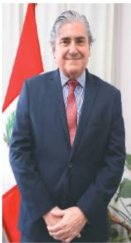
秘鲁驻华大使马尔科·巴拉雷索近照。

中秘已形成“你中有我，我中有你”的经贸合作格局，巴拉雷索对“脱钩断链”“去风险”等论调的危害有清醒认识。“脱钩”对所有人都有风险，因为我们生活在同一个地球村，在不同领域相互依存。“脱钩”相当于人为切断产业链供应链，给正常贸易往来设置障碍。秘鲁反对任何形式的“脱钩”，秘鲁是非常开放的经济体，坚定维护多边贸易体制，希望和所有国家发展经贸关系。”巴拉雷索表示，作为2024年亚太经合组织领导人非正式会议东道主，秘鲁期待与中国等其他成员共同发出维护多边贸易体制的声音。秘鲁也是《全面与进步跨太平洋伙伴关系协定》(CPTPP)成员，巴拉雷索对中国申请加入CPTPP表示赞赏。他说，中国主动对标CPTPP的高标准是积极的一步，释放世界第二大经济体扩大开放、支持贸易和投资自由化便利化的信号。