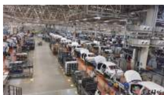
市商務局到廣汽埃安公司開展招商引資活動。