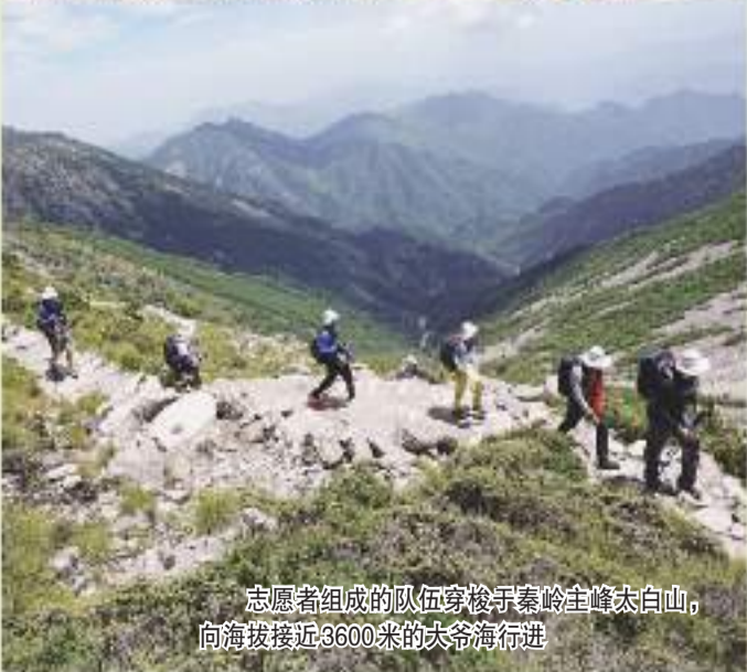
志愿者组成的队伍穿梭于秦岭主峰太白山,向海拔接近3600米的大爷海行进