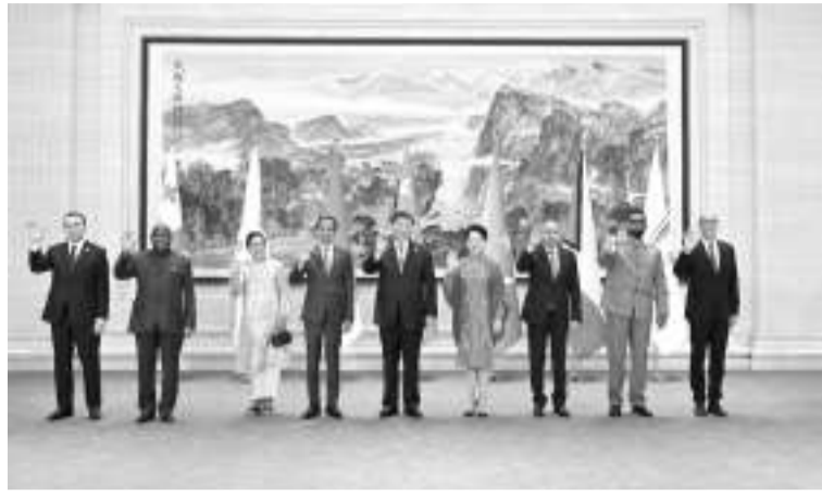
7月28日中午,中国国家主席习近平和夫人彭丽媛在四川省成都市金牛宾馆举行宴会,欢迎出席成都第31届世界大学生夏季运动会开幕式的国际贵宾。这是习近平和彭丽媛同贵宾们合影留念。

表中国政府和中国人民对来华出席成都第31届世界大学生夏季运动会开幕式的国际贵宾表示热烈欢迎。