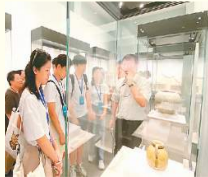
上图均为2023“中国寻根之旅”夏令营河北营管营员参加夏令营活动。

世界华人学生作文大赛始创于2000年，是由中国侨联、全国台联、人民日报海外版、《快乐作文》杂志共同主办的世界性华人写作比赛，至今已成功举办23届。