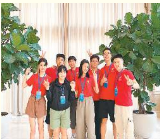
第二十三届世界华人学生作文大赛部分参赛选手合影。