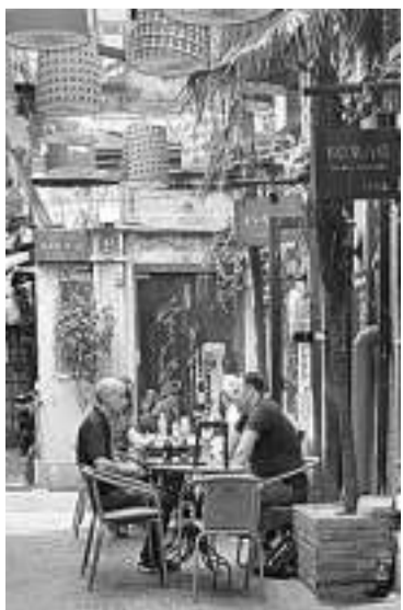
在窄巷里光顾咖啡档的老外

由第一进门厅进入第二进轿厅、到第三进厅，厅堂上方书有“玉燕堂”三个字，再进入第四进堂楼……果然大院深宅，雕梁画栋。走出院落又是一番光景，只见山石点缀，花团锦簇，曲径通幽，一隅的小池塘里饲养的金鱼在水中欢快的游弋。好一幅庭院美景，引得游客们纷纷在此拍照打卡。