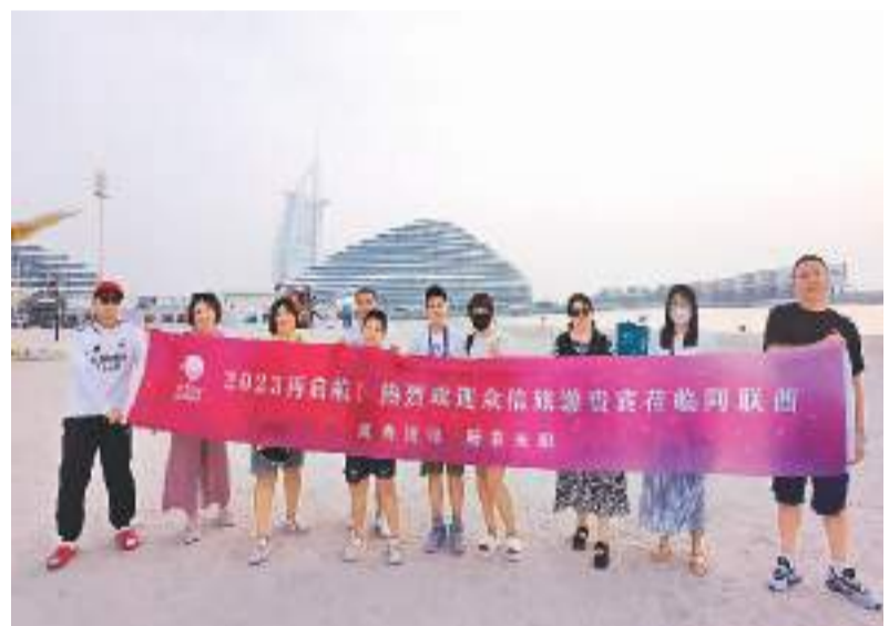
暑期，中国游客到访阿联酋。