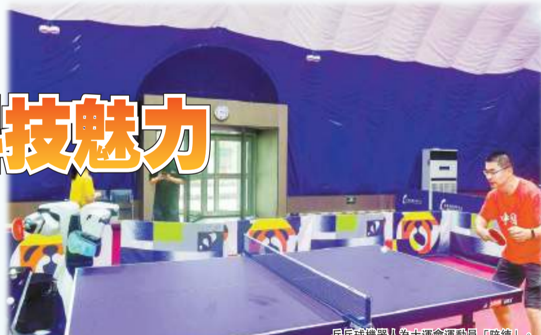
乒乓球機器人為大運會運動員「陪練」。

成都大運會不僅是一場體育盛會，更是高新科技水平與成果展示的盛會。在本屆大運會中，從開幕式到閉幕式、從場館建設到賽事保障、從主媒體中心到大運村，科技創新無處不在，在為參賽和觀賽提供便利的同時，也體現了成都這座城市的科技實力和創新活力。