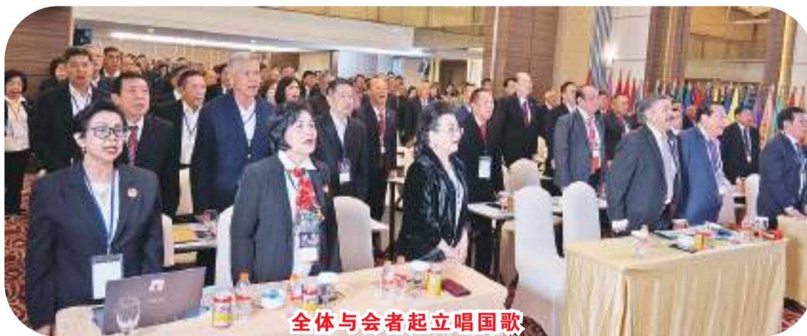
全体与会者起立唱国歌