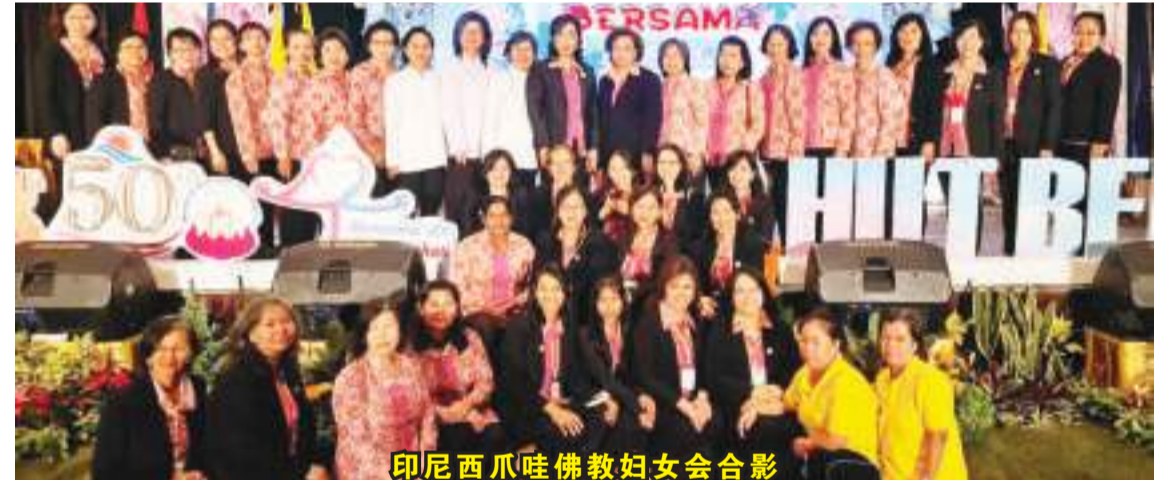
印尼西瓜哇佛教妇女会合影