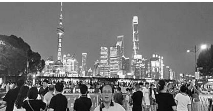
由南京路步行街远望浦东灯火灿烂的夜景

6月15日，在酒店餐厅乘坐早餐后，我们就带行李乘景区环保车前往转车处换乘我们的旅游车，继续前往上海的最后行程。