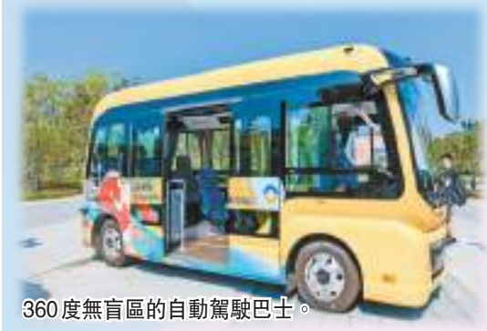
360度無盲區的自動駕駛巴士。

今晚，第31屆世界大學生夏季運動會將拉開帷幕，聚光燈下的成都正以此為卷，展開一座城市的智慧敘事。聚光燈的背後，更有着科技實力和創新活力為大運會保駕護航。