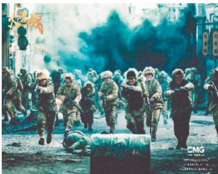
▲电视剧《大决战》剧照

“上兵伐谋。”军事斗争中的战略战术是人类智慧的结晶，敌我双方的斗智斗勇导致战斗进程既悬念迭出又瞬息万变，为故事的讲述增加了许多变数和反转，也极