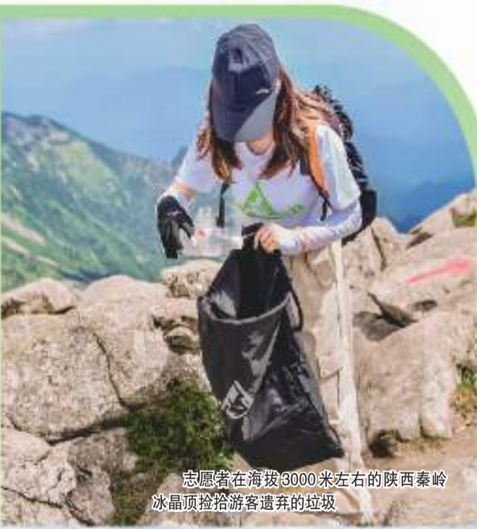
志愿者在海拔3000米左右的陕西秦岭冰晶顶捡拾游客遗弃的垃圾