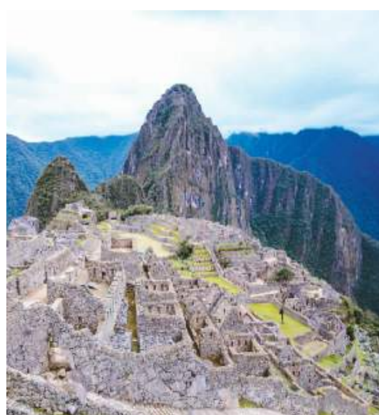
秘鲁马丘比丘遗址。

除了人们熟知的印加文明，查文、纳斯卡、莫切、瓦里、西坎、契穆等众多文化也在秘鲁这片土地上绵延生息。雄伟的建筑、精美的石雕、华丽的织物、多彩的陶器、炫目的金器……探索秘鲁文化的旅途上有看不够的风物。