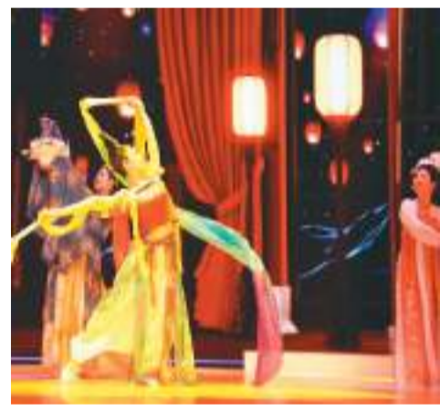
▲河南洛阳沉浸式实景剧《唐宫乐宴》的舞蹈演员在《妙不可言》节目中表演

探究传统习俗之妙、领悟非遗项目之妙、揭秘智能科技之妙、展示大国重器之妙……近期，河北卫视播出的人文类综艺节目《妙不可言》探访20多个省区市的80多个县，追溯五千年中国历史文化，展现了新时代新风貌，获得好评。