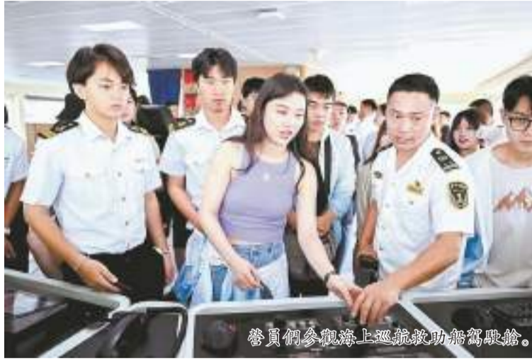
營員們參觀海上巡視救助船駕駛艙。