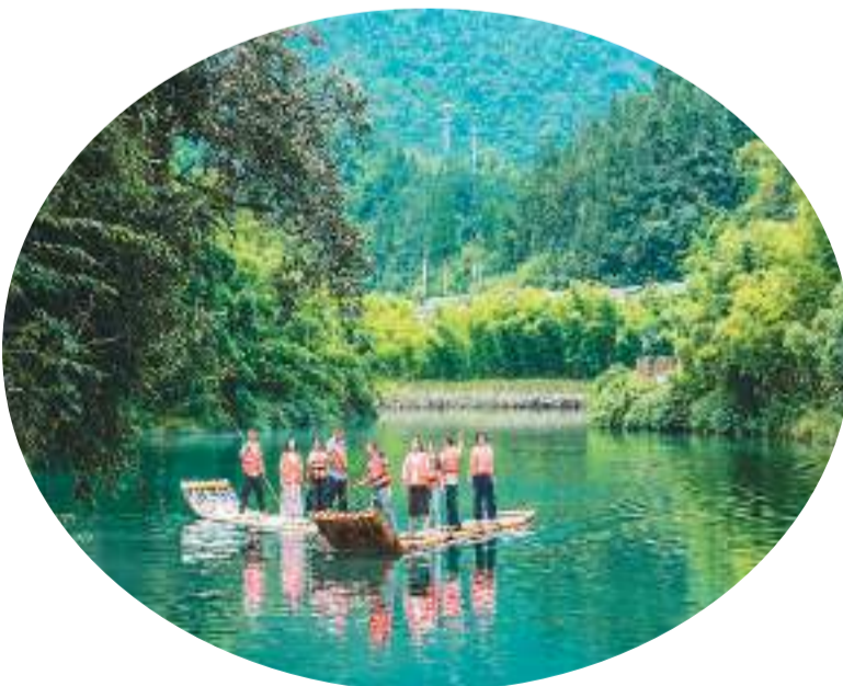
游客在湖北省秭归县三峡竹海生态景区体验竹筏戏水。

今年暑期，文旅消费市场分外火热。美团、大众点评数据显示，暑期以来，国内游消费订单（包括酒店民宿、景点门票、交通等）较2019年同期翻倍增长，夜经济引领夜间消费……暑期成为提振消费的重要时机。