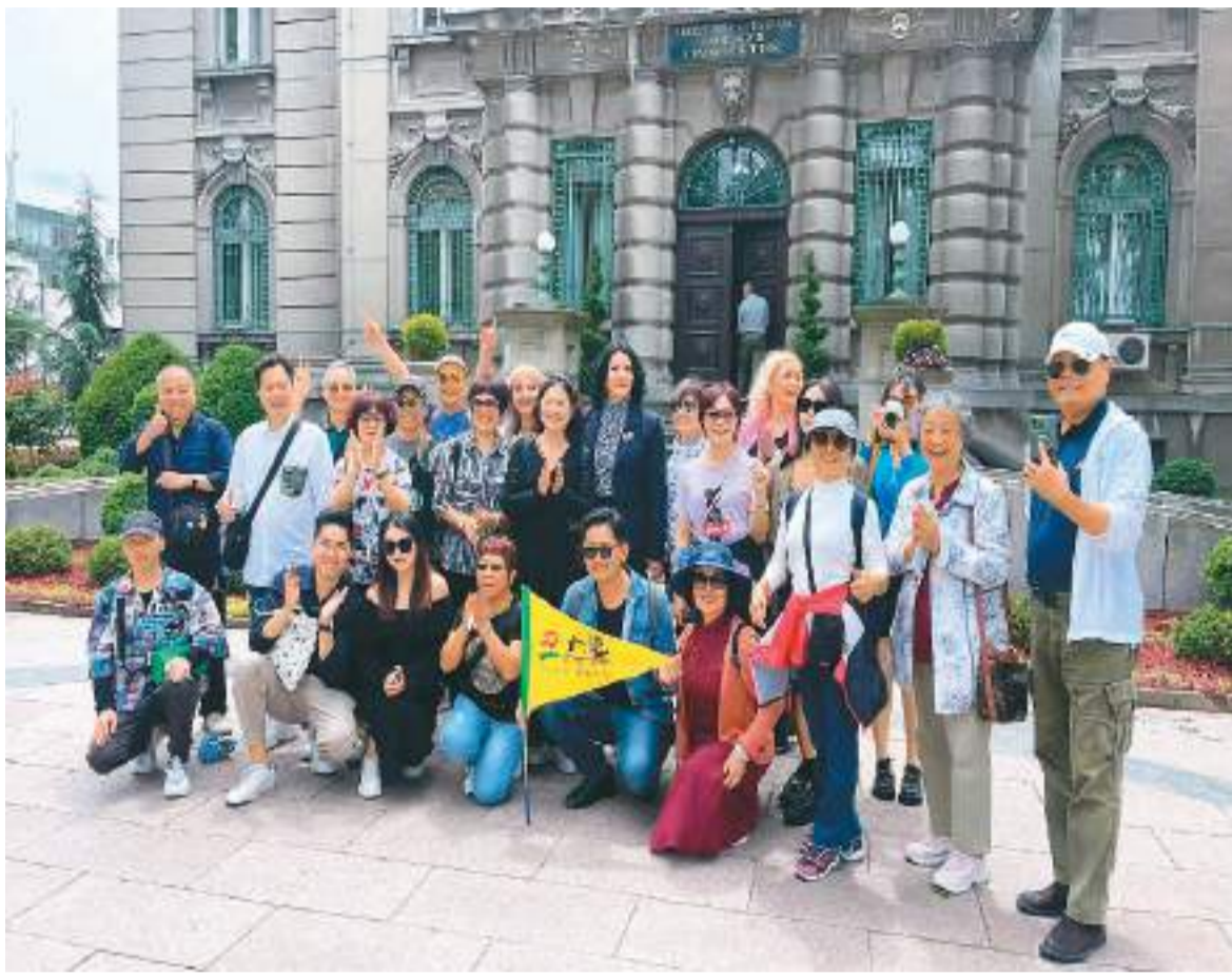
暑期，中国游客游览塞尔维亚。

广之旅推出的暑期泰国线路满足了游客“传统+新晋”“经典+网红”等复合型需求，安排游客游览今年泰国新晋地标水门寺金色大佛、中国综艺节目的