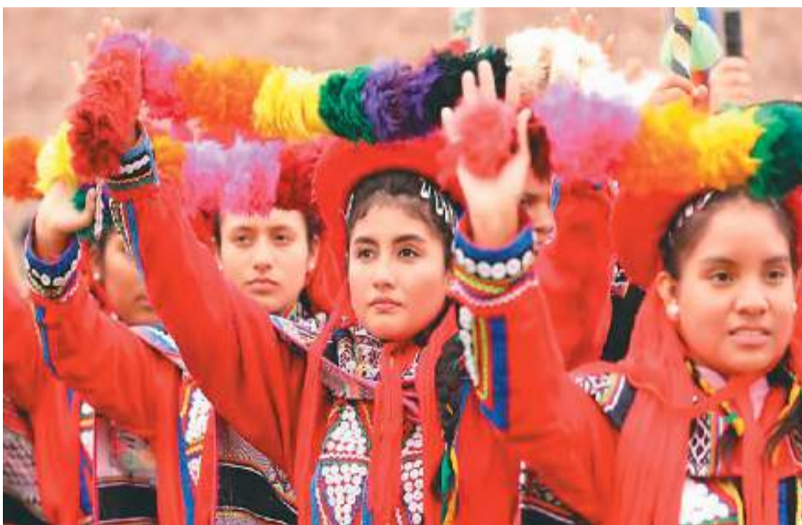
在秘鲁首都利马，人们身穿传统服装参加当地传统活动。

“我们努力向中国社会各界展示秘鲁丰富多彩的文化，希望中国朋友更好地了解秘鲁历史，了解秘鲁是怎样一个国家。”巴拉雷索大使说。面对栏目组的镜头，他向中国朋友发出真诚邀约：“秘鲁不仅有著名的马丘比丘，还有许多值得一去的地方。”