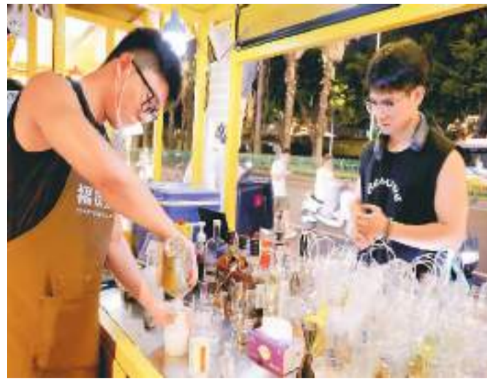
盛夏时节，福建省福州市台江区多处夜市灯火通明、人头攒动，吸引不少市民前来游览观光，打卡购物。近年来，台江区不断丰富夜间经济消费业态，以优质服务确保各项税费支持政策“红包”精准落地，为夜间经济发展提供政策支持。

举办的首个半程马拉松比赛。本次比赛将于11月19日举行，8月14日起接受公众报名，分团体组和公开组，共8000个名额。比赛全程约21.1公里，起点位于港珠澳大桥香港口岸。