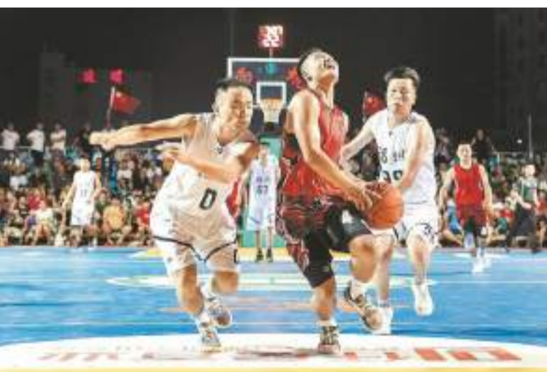
福州南嶼隊和福鼎點頭隊（紅衣）在比賽中。

除了為家鄉的子弟加油，助威團還有一個重要的任務，那就是推廣福鼎白茶。在兩場比賽的間歇，助威團中的孩子總會舉着提前做好的宣傳旗幟，繞着球場跑上幾