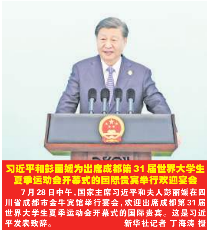
习近平和彭丽媛为出席成都第31届世界大学生夏季运动会开幕式的国际贵宾举行欢迎宴会 7月28日中午,国家主席习近平和夫人彭丽媛在四川省成都市金牛宾馆举行宴会,欢迎出席成都第31届世界大学生夏季运动会开幕式的国际贵宾。这是习近平发表致辞。