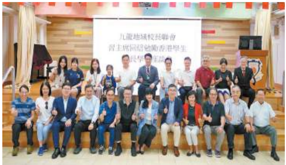
▲九龍地域校長聯會舉辦「習主席回信勉勵香港學生校長學習座談會」。