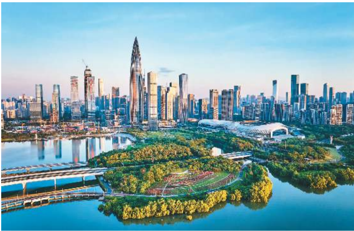
7月27日，晨曦映照下，广东省深圳市南山区深圳湾高楼林立，景色宜人。多年来，南山区坚持经济高质量发展与生态环境高水平保护“相互促进、相得益彰”，走出了一条“让保护更严格，让发展更充分”的生态文明建设新路，显著提升了市民的获得感与幸福感。