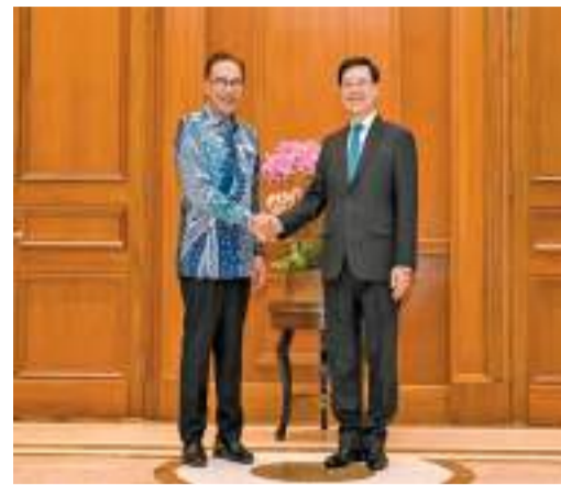
李家超(右)在吉隆坡與馬來西亞總理安華會面。

【香港商報訊】記者戴合聲報導：行政長官李家超昨日率領香港特區代表團轉抵馬來西亞吉隆坡訪問，與馬來西亞總理安華會面，與當地工商界領袖交流。