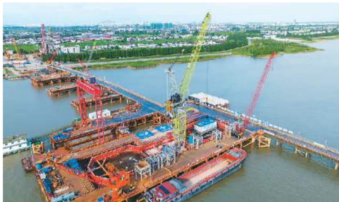
近日，位于江苏省张家港市的张靖皋长江大桥主桥建设进入塔柱施工阶段，该大桥全长约30公里，跨江段长7859米，其中跨度2300米的南航道桥为世界最大跨度桥梁。图为由中交二航局施工的大桥南航道桥塔柱首节段钢塔吊装现场。

主会场设有“新时代 新经典 新征程——学习贯彻习近平新时代中国特色社会主义思想主题出版展”暨全国图书精品展、绿色创意印刷展、“我的书屋·我的梦”主题书画展等。书博会期间，将组织开展全民阅读“红沙发”系列访谈、韬奋基金会“书香润齐鲁”图书捐赠、实体书店来自全国各省（区、市）和港澳台的1700多家出版印刷发行单位参展，主会场共设置8个展馆，展览面积达10万平方米。本届书博会将持续至7月31日，面向读者免费开放。