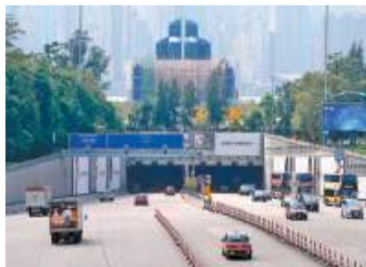
政府下周三接收西區海底隧道，並實施三隧分流的「633」固定收費方案。

在8月2日零時零分，西隧及東隧將短暫封閉約5分鐘，以便更新收費設施。駕駛者須留意由香港西區隧道有限公司售出以繳付西隧費用的隧道費代用券，以及現時提供的商業推廣優惠，包括深宵優惠