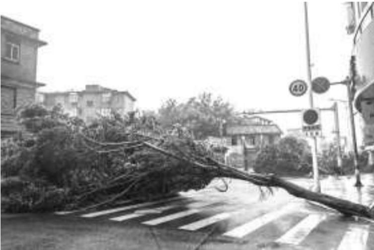
7月28日,强台风“杜苏芮”在福建泉州晋江沿海登陆,泉州中心市区树木倒伏。

为“二手”台风,而“杜苏芮”是少见的绕过台湾岛、直接登陆福建的“一手”台风,东南沿海防台风压力也随之加大。