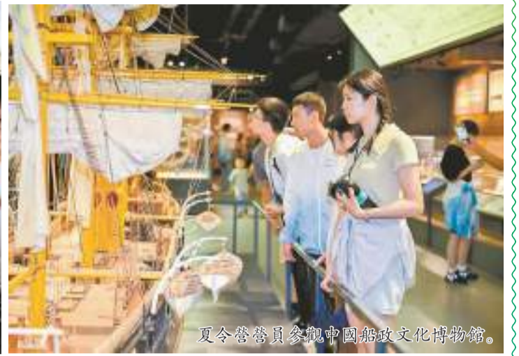
夏令營營員參觀中國船政文化博物館。

在福建船政發展軌跡中觸摸歷史滄桑變革；探訪“媽祖故里”感悟兩岸共同的信仰文化；走進泉州九日山追尋古代“海絲”遺迹……7月16日至22日，第二十屆臺胞青年千人夏令營福建航海文化分營在炎熱夏日中匯聚熱情似火的兩岸青年。