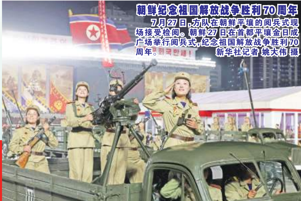
朝鲜纪念祖国解放战争胜利70周年 7月27日,方队在朝鲜平壤的阅兵式现场接受检阅。朝鲜27日在首都平壤金日成广场举行阅兵式,纪念祖国解放战争胜利70周年。