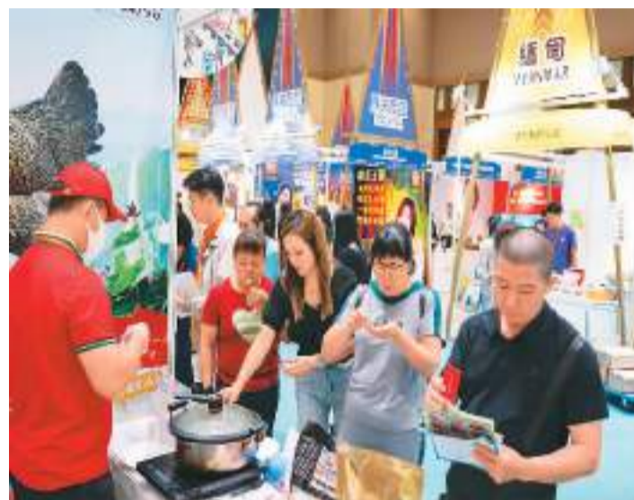
7月27日，人们在2023粤澳名优商品展“一带一路”展区参观。

新华社澳门7月27日电（记者李寒芳）为期4天的2023粤澳名优商品展27日在澳门揭幕，汇聚438家企业现场展销，50多场精彩活动轮番登场。