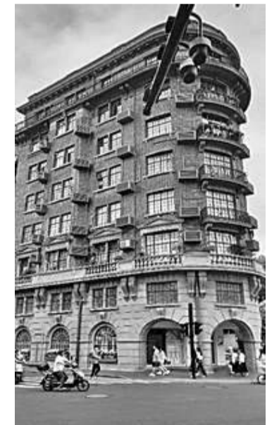
宋庆龄故居博物馆

改革开放后，新浦东的开发和发展，让这片曾经被贬称为“宁要浦西一张床，不要浦东一间房”的新开发区成为上海乃至中国现代化科技产业创新发展的热土。