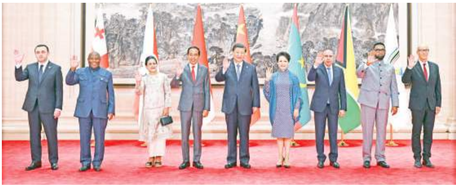
7月28日中午,中国国家主席习近平和夫人彭丽媛在四川省成都市金牛宾馆举行宴会,欢迎出席成都第31届世界大学生夏季运动会开幕式的国际贵宾。图为习近平和彭丽媛同贵宾们合影留念。