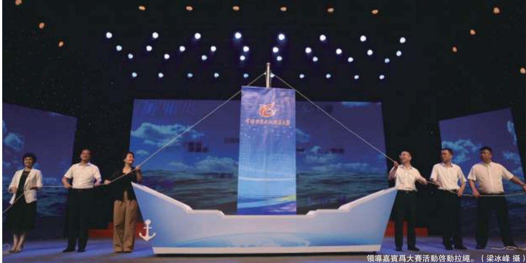
領導嘉賓為大賽活動啓動拉繩。