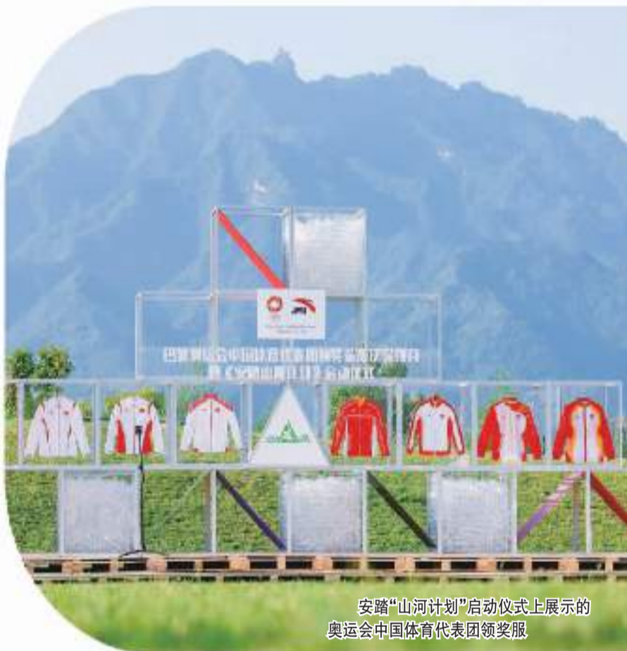
安踏“山河计划”启动仪式上展示的奥运会中国体育代表团领奖服