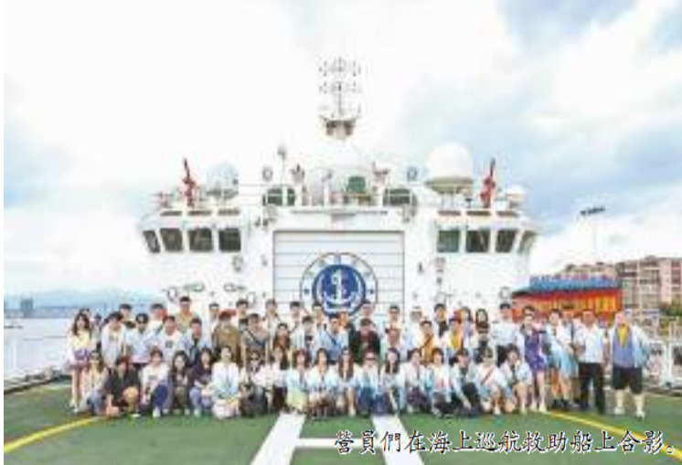
營員們在海上巡視救助船上合影。