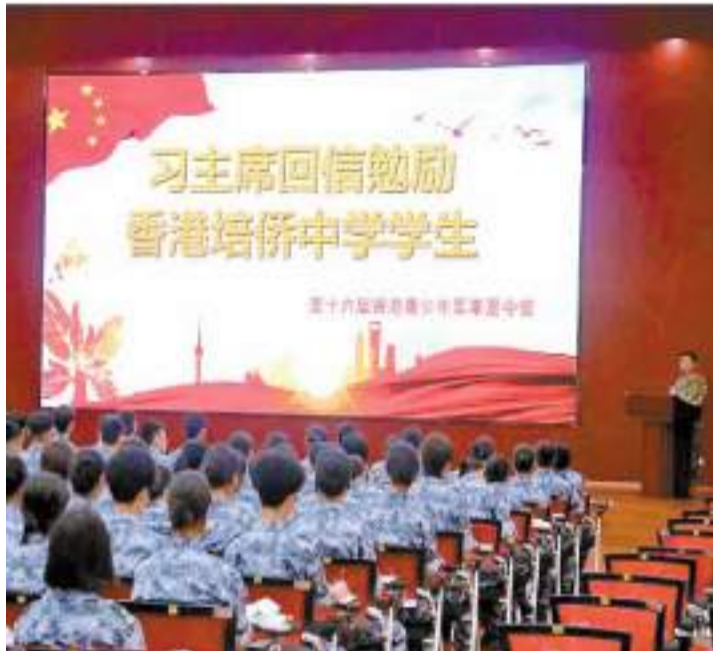
▶香港青少年軍事夏令營學員一起學習領會習主席回信培僑學生重要精神。