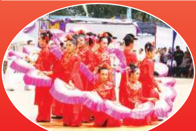
学生表演中国才艺