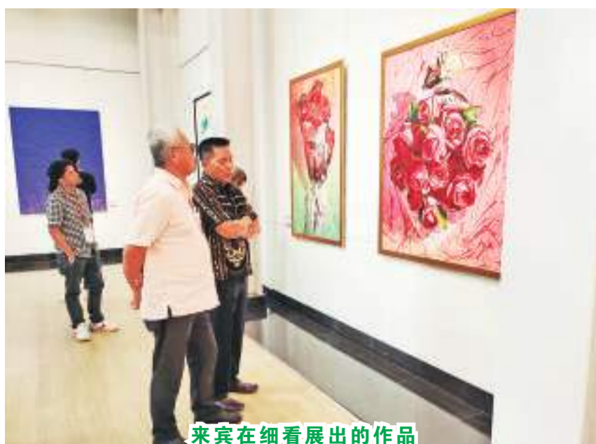
来宾在细看展出的作品