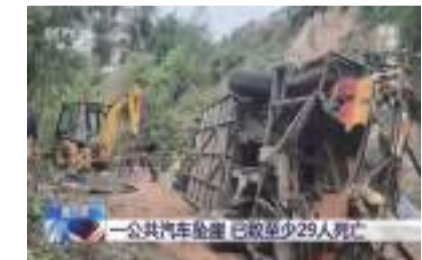
一公共汽車墜崖 已致至少29人死傷