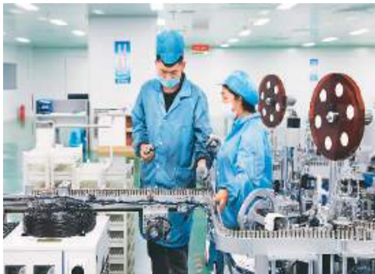
甘肃省金昌市培育壮大新能源和动力电池千亿级产业集群，目前已有总投资300多亿元的30多个新能源电池及电池材料项目建成投产。图为近日，在位于金昌经济技术开发区的甘肃金宏翔新能源有限公司，工人在电池生产线上作业。

——建立积分灵活性交易机制，探索建立积分池制度。上述负责人介绍，由于积分供需会因为技术进步、市场结构变化而变化，经充分征求行业企