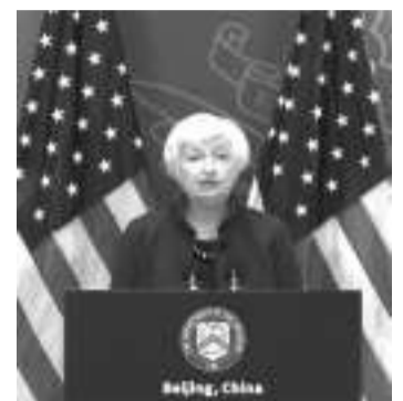
9日,北京,耶伦在美国驻华大使馆召开新闻发布会耶伦推特视频截图

宣布,经中美双方商定,美国财政部部长耶伦将于6日至9日访华。与美国国务卿布林肯访华之行类似,早在今年年初,美国就不断放出消息称耶伦“期待访华”,但始终未能成行。此访成行,意味着耶伦首次以财长身份访华,她也是继美国国务卿布林肯之后,第二位访问北京的拜登内阁成员。