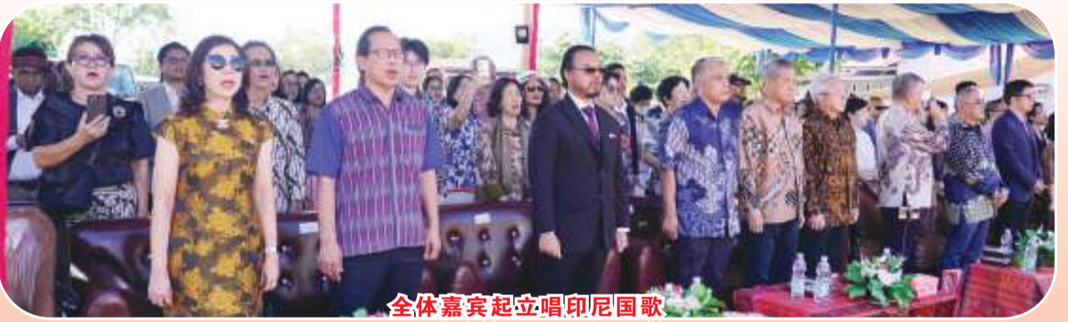
全体嘉宾起立唱印尼国歌