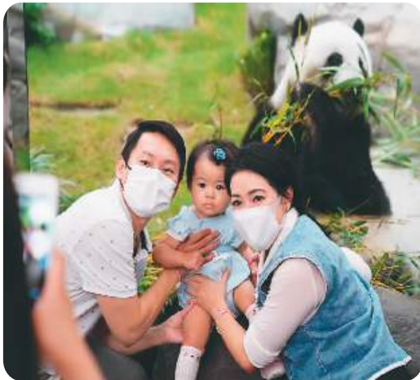
▲ 在香港海洋公园，游客和大熊猫“盈盈”合影。

17岁的“乐乐”“盈盈”，以及此前“寿终正寝”的“佳佳”“安安”，这四只中央赠港大熊猫是大家心尖上的宝贝。在护理员和“粉丝”的关心下，因身材圆滚滚而被昵称为“滚滚”的大熊猫，在香港收获了“滚滚不断”的幸福。