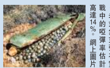
戰中的啞彈率估計高達14%。

美國陸軍前拆彈專家沃斯伯格解釋，造成這種差異是美軍內部試驗集束彈時，通常選在地勢平坦、土壤較硬、植被稀少的區域，是集束彈爆炸的理想環境，「然而在實戰中，集束彈可能落在水中、沙地、泥漿或鬆軟地面，若沒有擊中硬物，或是掛在樹枝和灌木叢中，炸彈就沒有足夠衝擊力爆炸。」