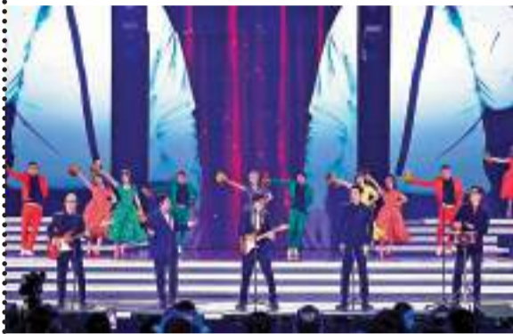
◆溫拿日前有份演出《灣區升明月》晚會,炒熱現場氣氛。

香港文匯報訊(記者達里)成軍50年的溫拿樂隊接受香港電台第一台《舊日的足跡》訪問,分享音樂路上的難忘回憶,並向曾經幫助他們的人表達謝意。他們更透露將會出版書籍記錄半世紀的經歷。