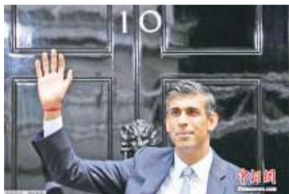
资料图：英国首相苏纳克。

曾发布声明称，英美的联盟“比以往任何时候都更加重要”，英国既是欧洲主要的北约盟友，也是美国“最重要的贸易、防务和外交伙伴”，并且英国在援助乌克兰问题上发挥着重要作用。