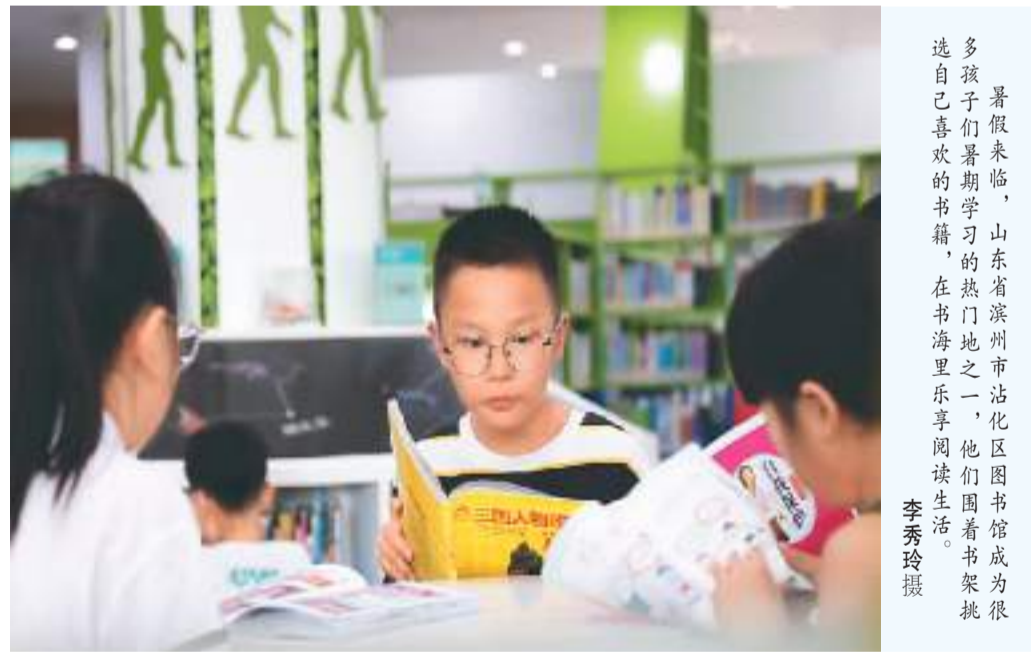
暑假来临，孩子们暑假学习的热门地之一，山东省滨州市沾化区图书馆成为很多孩子喜欢的“打卡地”。