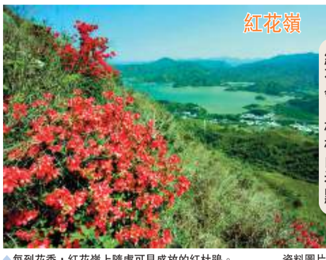
紅花嶺 每到花季，紅花嶺上隨處可見盛放的紅杜鵑。