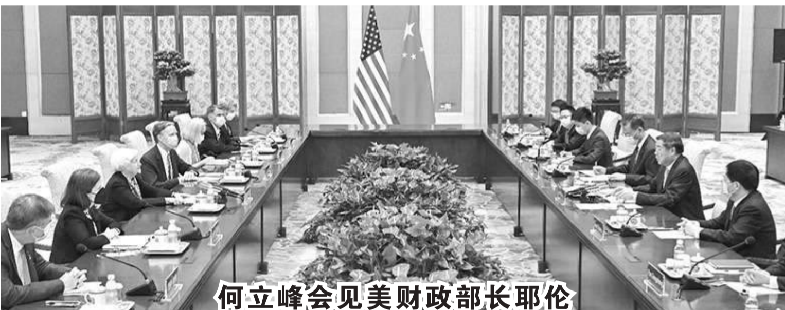
何立峰会见美财政部长耶伦

五是强化监督管理和法律责任。规定私募投资基金业务活动的监督管理应当贯彻党和国家路线方针政策、决策部署。明确国务院证券监督管理机构的监管职责及监管措施等。规定国务院证券监督管理机构会同国务院有关部门和省级人民政府建立私募投资基金监督管理信息共享、统计数据报送、风险处置协作机制。此外,对违反本条例的法律责任作了明确规定。