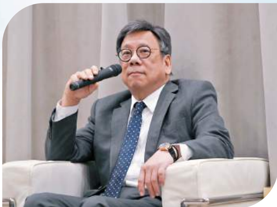
◆香港商經局局長丘應樺表示，外資對香港的投資環境十分有信心。