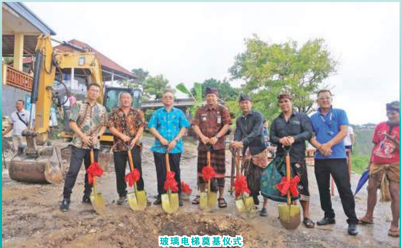
玻璃电梯奠基仪式