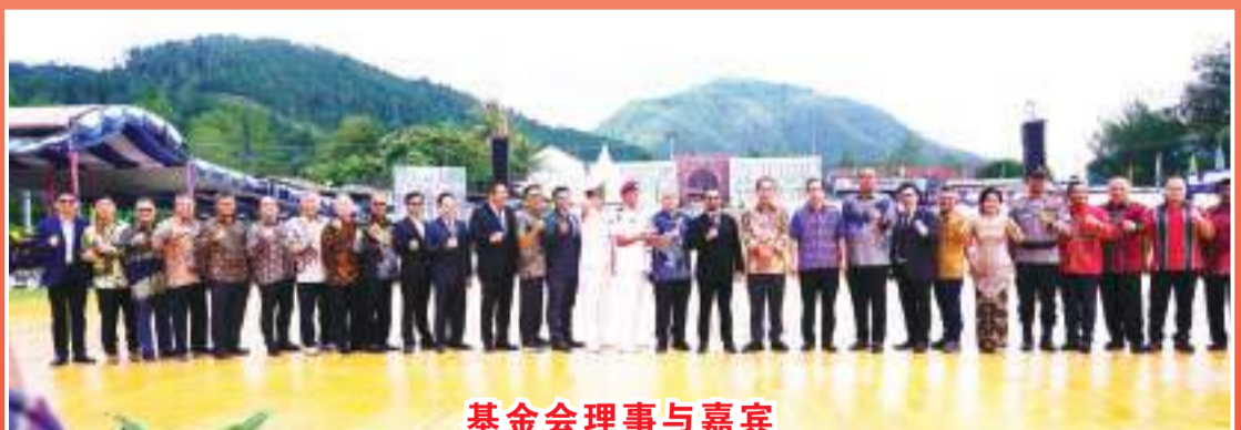
基金会理事与嘉宾