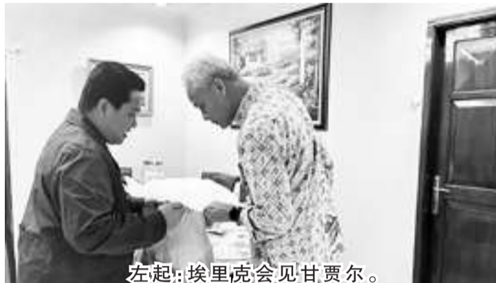
左起:埃里克、会见甘贾尔。

【本报讯】7月8日,经济部长善迪亚卡。目标相同的,即对副总统哈斯托表示,甘贾尔已亲自进行个人接触行动,与几位众人熟悉的人物讨论2024年副总统人选问题。其中,甘贾尔亲自与马福进行了接触,目前马福担任政治、法律与安全统筹部长,甘贾尔曾多次会见马福。马福是印尼斗争民主党考虑的甘贾尔的竞选搭档候选人之一,马福是斟酌中的10个人物之一。 除了马福之外,甘贾尔还会见了国企部长埃里克,以及旅游业与创意