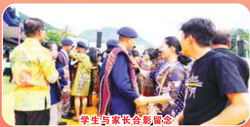
学生与家长合影留念