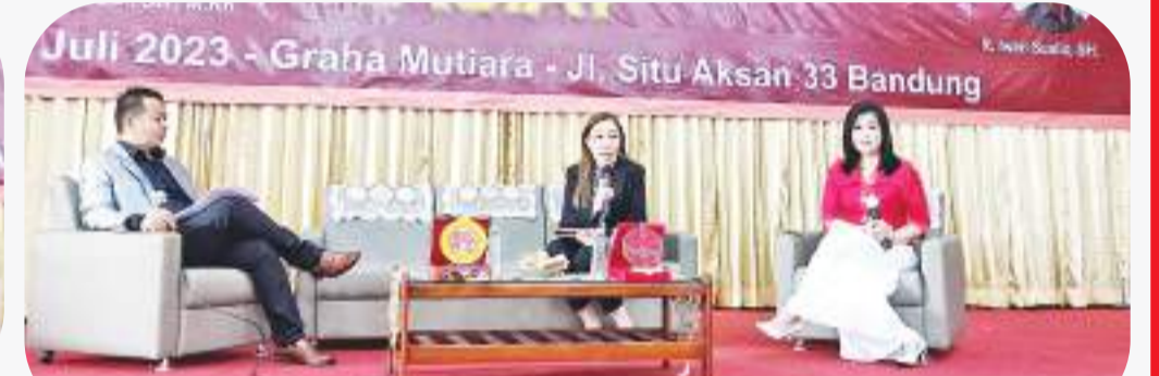
发言人和主持人在脱口秀之际