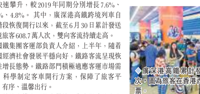
廣深港高鐵累計發送旅客608.7萬人次，圖為旅客在香港西九龍高鐵站購買車票。

廣深港高鐵覆蓋49城市 雙向客流持續走高 在優化區域客運產品，便利人員交流往來方面，該負責人提到，廣深港高鐵跨境列車1月15日分段恢復開行以來，目前已覆蓋內地49個城市68個車站，每日開行跨境列車達182列，截至6月30日累計發送跨境旅客608.7萬人次。而中老鐵路4月13日首開國際旅客列車以來，截至6月30日累計發送跨境旅客3.3萬人次。