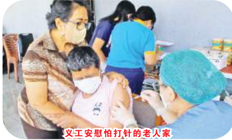
义工安慰怕打针的老人家