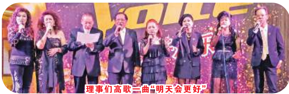
理事们高歌一曲“明天会更好”