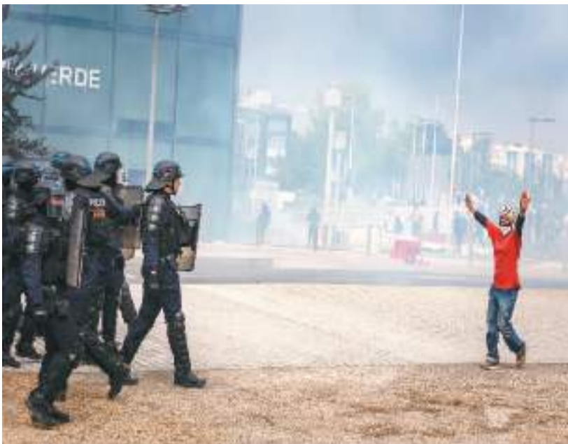
六月二十九日，在法国上塞纳省楠泰尔市，示威者与警察发生冲突。

“法国骚乱暴露了欧洲社会治理的共性问题。解决问题的思路不能‘头疼医头、脚疼医脚’，也不能各自为政。此次骚乱事件，事态的外溢已经充分证明了这一点。在欧盟体系内，涉及法规及社会政策的调整无法由各国自行完成。要想妥善应对经济和社会的各项挑战，欧盟层面有必要加强政治、经济及法律层面的协同机制，加强共同治理。而这将是一项长期的系统性工程，无法短期内一蹴而就。”赵永升说。