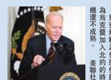
拜登解釋為什麼他認為烏克蘭加入北約的時機還不成熟。

16日在為期兩天的北約防長會後表示，邀請烏克蘭加入北約將不會成為維爾紐斯峰會上討論的議題。斯托爾滕貝格同時提到，北約各方正在籌建一個全新的「北約—烏克蘭理事會」，在此框架下，烏方和北約國家將在「平等」基礎上協商安全問題。