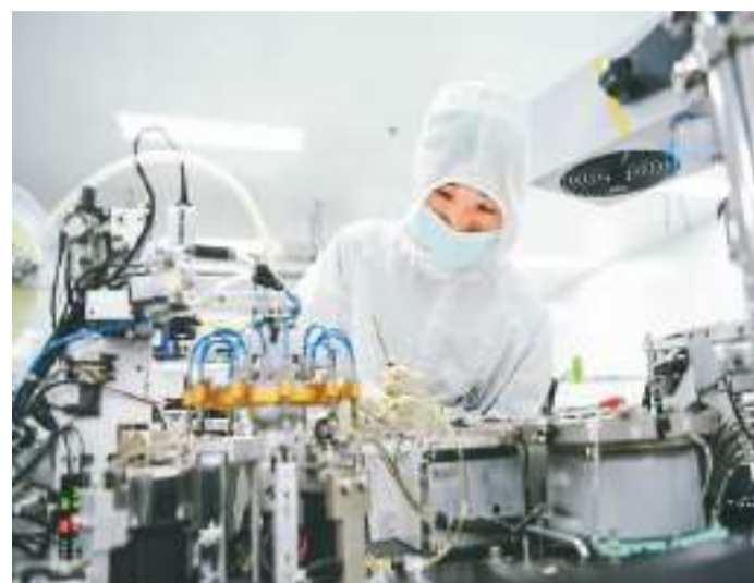
江西省南昌市围绕硅衬底LED这一核心技术，全力打造“南昌光谷”，逐步形成完善的LED产业链，LED芯片产能跃居全球前列。图为7月5日，在位于南昌高新区的晶能光电股份有限公司数字化封装生产车间，工作人员正在忙碌。

外汇局相关负责人介绍，6月，美元指数下跌，全球金融资产价格涨跌互现。在汇率折算和资产价格变化等因素综合作用下，当月外汇储备规模上升。