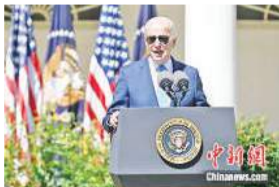
资料图：美国总统拜登。

中新网7月9日电 据路透社报道，当地时间9日，美国总统拜登将抵达英国展开访问，其间将会见英国首相苏纳克和英国国王查尔斯三世。