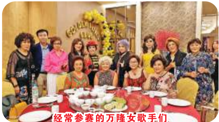
经常参赛的万隆女歌手们