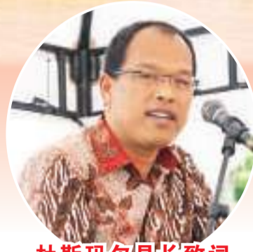
杜斯玛尔县长致词

接着,巴厘阁中学的同学们带来了具有地方特色的舞蹈表演、武术表演、中国才艺展示等,学生们精彩的表演引来阵阵掌