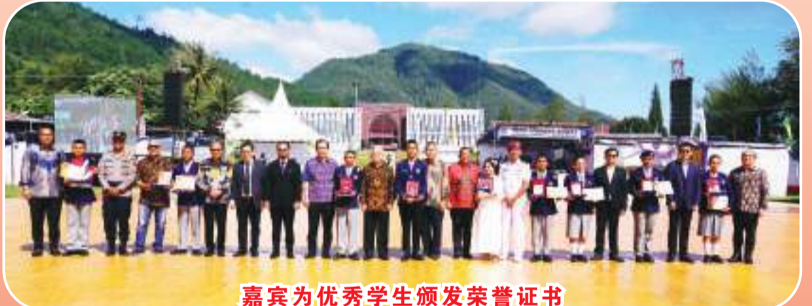
嘉宾为优秀学生颁发荣誉证书