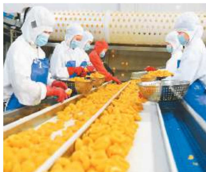
江苏省连云港市东海县汇祥食品有限公司充分依托当地资源优势，积极对接“一带一路”沿线国家订单需求，推动优质果品出口创汇，带动地方果品种植、采收、运输、销售等产业链发展壮大。图为7月5日，该公司工人在车间生产出口国外的黄桃罐头。

报告还显示，在监管机构的有力引导下，消费金融公司努力压降消费信贷的利费水平。2022年底，消费金融公司的加权平均综合定价和客户实际承担利率全部压降到监管规定的范围内。同时，消费金融公司高度重视消费者权益保护，为受疫情影响的客户解决实际困难。2022年，消费金融公司为受疫情影响的34万余名客户减免了51.9亿元的利息，为17.9万名客户减免了1.7亿元的费用，为9万多名客户协商延期还款58.9亿元，为12.5万名因为疫情影响而逾期的客户提供征信维护服务。