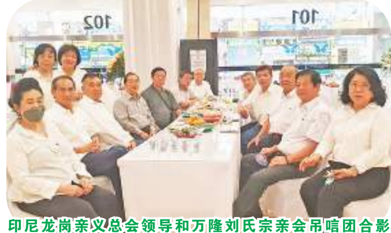
印尼龙岗亲义总会领导和万隆刘氏宗亲会吊唁团合影