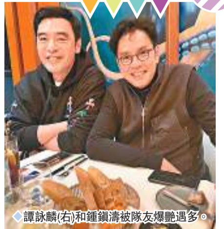
◆譚詠麟(右)和鍾鎮濤被隊友爆艷遇多。

香港文匯報訊(記者達里)成軍50年的溫拿樂隊接受香港電台第一台《舊日的足跡》訪問,分享音樂路上的難忘回憶,並向曾經幫助他們的人表達謝意。他們更透露將會出版書籍記錄半世紀的經歷。