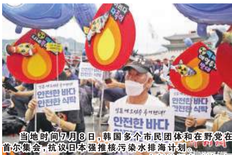
当地时间7月8日，韩国多个市民团体和在野党在首尔集会，抗议日本强推核污染水排海计划。

中新社首尔7月9日电 当地时间8日，韩国多个市民团体和在野党在首尔集会，质疑国际原子能机构关于日本福岛核污染水处置综合评估报告的可靠性，抗议日本强推核污染水排海计划。