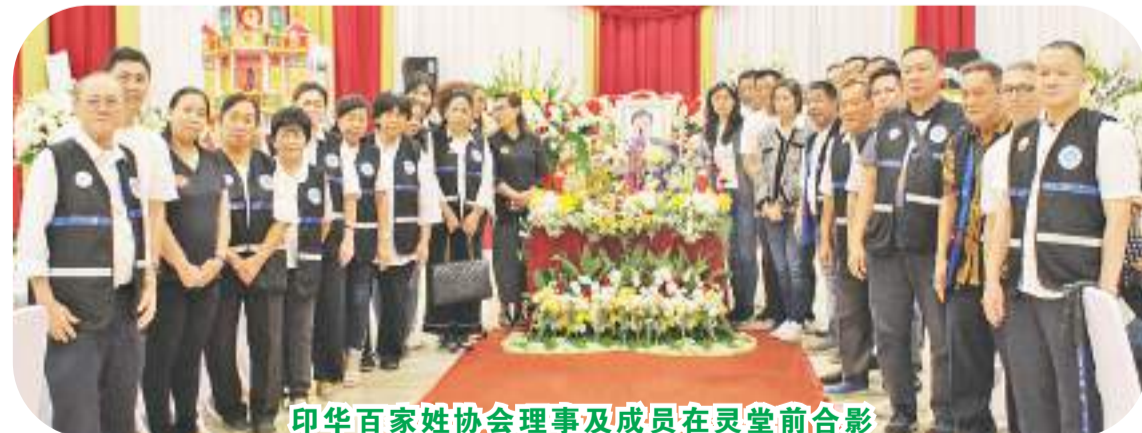
印华百家姓协会理事及成员在灵堂前合影