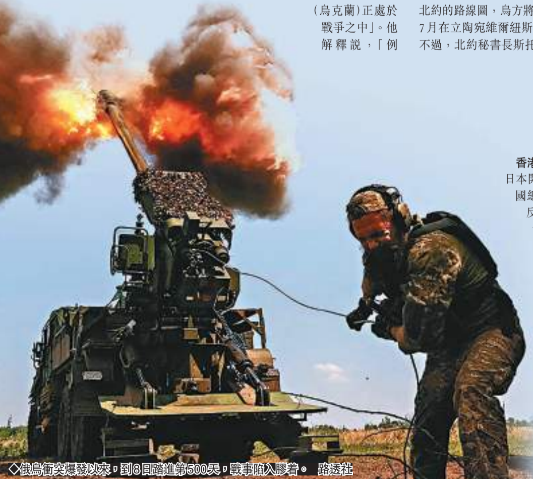
俄烏衝突爆發以來，到8日踏進第500天，戰事陷入膠着。

斯指出，這是國際社會取得的一項重大成就。銷毀所有已申報的化學武器是禁化武組織的一個重要里程碑，也是向實現永久消除所有化學武器目標邁出的「關鍵一步」。