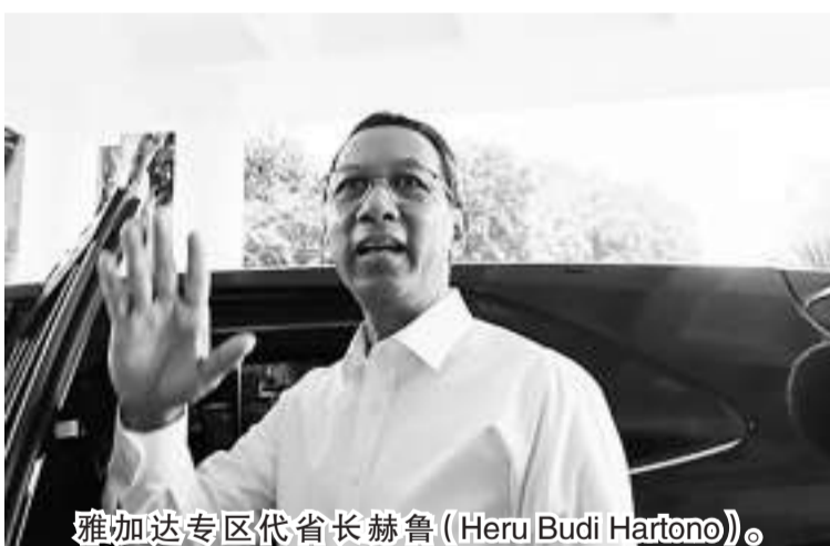
雅加达专区代省长赫鲁(Heru Budi Hartono)。

【本报讯】雅加达专区代省长赫鲁(Heru Budi Hartono)将通过省府和警方的介入,对雅加达中部的丹拿望市场G区进行整顿。 这个丹拿望传统市场购物区曾一度肃清了流氓地痞,然而后来却又恢复为乱七八糟的市场,甚至最近以来被怀疑是恶棍和吸毒者活动的温床。 赫鲁代省长上周末表示:“我会与雅加达中市区市长和警察共同进行检查。” 雅加达专区省府与雅加达中区警署的合作是因为丹拿望市场区存在犯罪问题。他说:“关于犯罪问题,我们将与警方合作肃清。” 此前,一些商贩抱怨丹拿望市场又变回以前的样子,尤其是G区在夜间存在流氓活动。自从受到新冠疫情影响而变得冷清以来,这个荒废的时尚中心的二楼和三楼转变成了流氓和犯罪分子的聚集地。 一位商贩D在7月6日(周四)在丹拿望市场G区一楼表示:“二楼以上是给小偷或歹徒的。其实本市场所有区块都存在不良分子,只是看我们要如何管理。” 他继续说道:“傍晚和晚上,二楼和三楼都有很