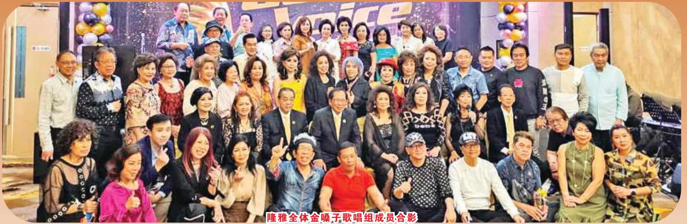
隆雅全体金嗓子歌唱组成员合影

【万隆讯】自疫情肆虐近三年来,万隆好多个歌唱组多数停滞不前。现在疫情不再猖獗,人们开始有各样活动,其中爱唱歌的人们陆续开始练唱了。