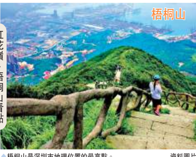
梧桐山 梧桐山是深圳市地理位置的最高點。 資料圖片