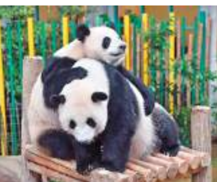
◆大熊貓寶寶「誼誼」和「升誼」29日晚間從馬來西亞乘飛機返回中國成都。

此外，「誼誼」和「升誼」這兩個名字都是由馬來西亞國家動物園向當地全社會徵集選出的，象徵着中馬兩國友誼牢不可破。