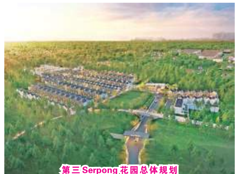
第三 Serpong 花园总体规划

50m 2 ；Samara 型，房屋面积50平方米/土地面积60平方米；Kazan 型，房屋面积54平方米/土地面积72平方米，Belarus 型，房屋面积90平方米/土地面积105平方米。(BAM)