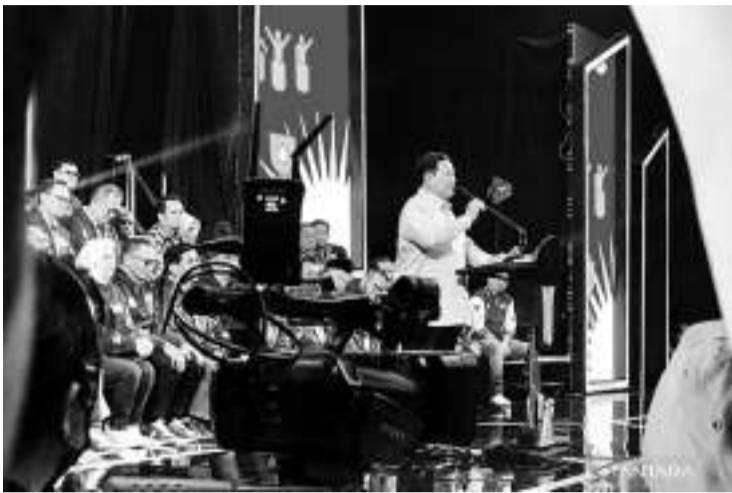
普拉波沃宣布大印度尼西亚复兴联盟更名为印度尼西亚前进联盟。

【本报讯】大印尼行动党主席普拉波沃在面临2024年选举中，宣布了大印尼行动党与从业党、民族复兴党、国民使命党和星月党的新的联盟名称，从之前的大印度尼西亚复兴联盟(KIR)更名为印度尼西亚前进联盟(KIM)。 这个名称与佐科维赢得2019年大选的联盟名称相同。印度尼西亚前进这个名称也是佐科维在第二个任期(即2019-2024年)内阁的正式名称。普拉波沃声称已就印