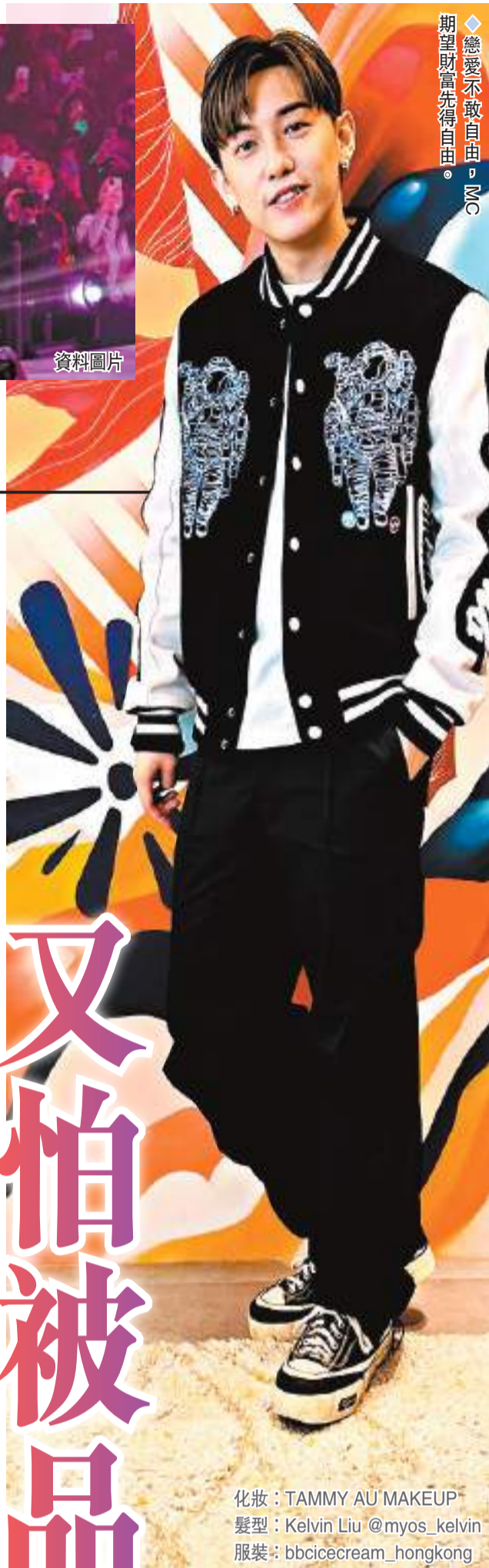
戀愛不敢自由，MC期望財富先得自由。