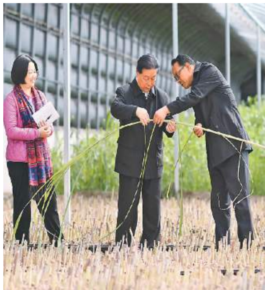
宁夏回族自治区灵武市郝家桥镇团结村的巨菌草收割现场。

“菌草技术因扶贫而诞生和发展。现在，菌草产业已从‘以草代木’生产菌菇拓展到‘以草代煤’发电、‘以草代粮’发展畜牧业等6个领域12个产业。”林占熺说，尽管菌草