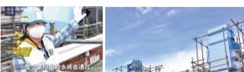
▲央視記者進入福島核電站，實地探訪日本核污水排海設備。 視頻截圖

香港文匯報訊 據中新社報道：中國駐日本大使吳浩28日應約會見日本外務事務次官岡野正敬，就福島核污水排海問題進一步向日方闡明嚴正立場。吳浩指出，日方應停止為排海行為「洗白」，以真正負責的態度同周邊鄰國誠實溝通，接受國際社會嚴格監督，切實採取科學、安全、透明的方式處置核污水。