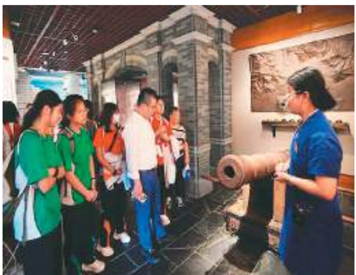
图为香港培侨中学师生参访林则徐纪念馆。

团师生除参访福州市的学校及历史纪念馆外，还参观了兴业银行历史馆、数据中心等，了解内地银行业发展现状。