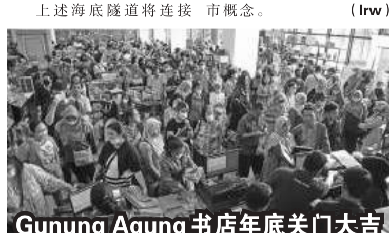
Gunung Agung书店年底关门大吉

按照计划,海底隧道的建设将由国家预算负责,但不排除可能采用公私合作伙伴关系的方式。公共工程与民居部采用的是穿越新首都努山达拉的麻里巴板海湾的海底隧道技术。这一建设符合佐科维总统提出的森林城市概念。(lrw)