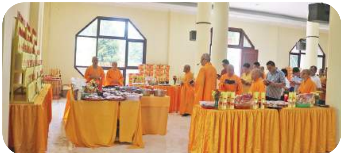
僧侣们为亡魂念经

【本报讯】2023年8月27日周日, Santoso 基金会管理的雅加达西区 Daan Mogot II 街门牌二 号南海观音寺举办“盂兰盆节”(Cioko/Ulambana) 祈祷活动。