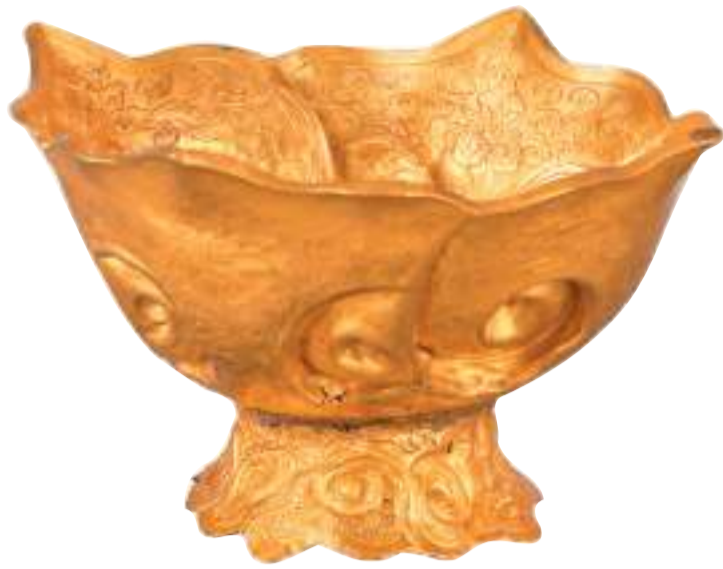
▲如意云边金盏，南京博物院藏。