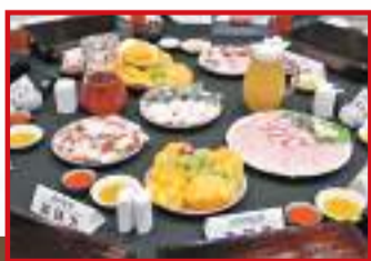
◆尹錫悅一訪立者舉行「海鮮例會」，圖證核污水安全。網上圖片

共同民主黨黨魁李在明批評尹錫悅的海鮮例會，稱「即使是現時（核污水已經排海），總統也應親自說出反對核污水排海」。亦有不少韓國網民嘲諷「總統府又開始做秀，這種把戲究竟要玩到什麼時候？」