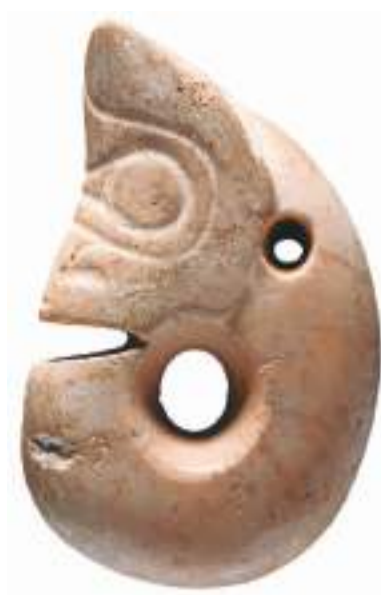
▲红山文化玉玦形龙。

1368年，朱元璋麾下大将徐达率军攻克元大都，结束了元代统治。展览结尾展出了无锡博物院藏《吴王手谕》，这是当时的吴王朱元璋写给左相徐达的一封信，谈论了张士诚部下越狱的事情。朱、张二人争夺天下，最终朱元璋大败张士诚，建立大明王朝，也揭开了北京城市发展的新篇章。