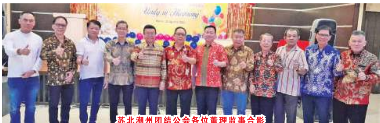
苏北潮州团结公会各位董理监事合影