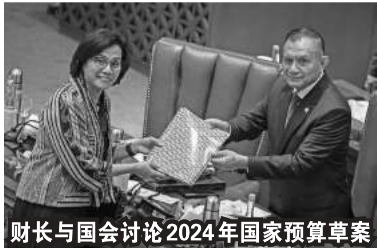
财长与国会讨论2024年国家预算草案

与此同时,印中高铁公司也与交通部共同验证高铁的便利设施及基础设施。该印中合资企业全力遵循规定的阶段,即在认证阶段的顺畅流程内准备提供各种需要的资料和信息。艾花在书写通过书面声明说:“印中高铁公司继续做好所有的准备工作,不论是车站运营或便利条件方面,其中是与车站有关的事项。以后车站开始为乘客提供服务时,肯定已准备好使用的通道。”(Ing)