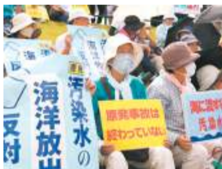
◆日本民眾在福島縣小名濱港舉行反核污水抗議。網上圖片

菲律賓漁民組織和環保組織成員26日聚集在日本駐菲律賓馬尼拉大使館前舉行示威，抗議日本的核污水排海行為。擁有逾10萬名會員的菲律賓全國小漁民組織聯合會表示，日本排放的核污水相當於「核廢料」，將導致菲律賓周邊海域和民眾受到影響，菲律賓漁民害怕人們再也不買魚，「如果日方認為經過處理排海的水是安全的，為什麼不直接排到東京灣？」還有抗議者稱「不能允許他國將海洋視為他們的下水道」。