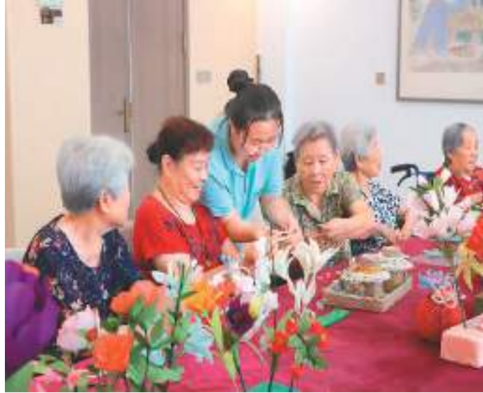
近年来，山东省滨州市沾化区全面整合辖区医疗和养老资源，推出“医疗+康复+护理+养老”一体化服务，实现医养产业绿色健康快速发展，让养老变“享老”。图为近日老人在沾化区大高镇国昌怡心园的护工指导下编织手工作品。

地，辣椒年综合产值超过200亿元。贵州省农业农村厅副厅长胡继承说，目前贵州已培育有20多个辣椒重点企业300余家，生产7大系列70多个品种，“小辣椒”已成“大产业”，贵州辣椒也在百姓“无辣不欢”的饮食文化中孕育出“香辣天下”的产业发展势头。