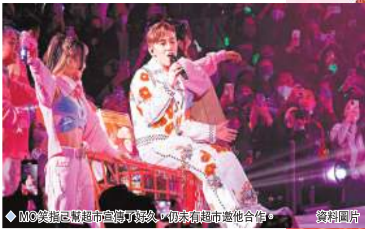
MC笑指已幫超市宣傳了好久，仍未有超市邀他合作。資料圖片