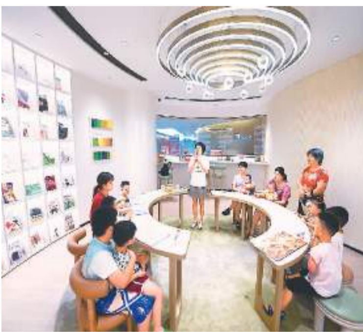
近年来，浙江省嘉兴市南湖区坚持以“一老一小”为重点，服务保障好“一老一小”重点群体。截至目前，辖区内共建有34家“向日葵亲子小屋”，定期向社区（村）的老人与孩童提供专业服务与健康指导。

图为在南湖区余新镇渔里未来社区“向日葵亲子小屋”的母婴沙龙内，孩子们在家长的带领下参加互动游戏。