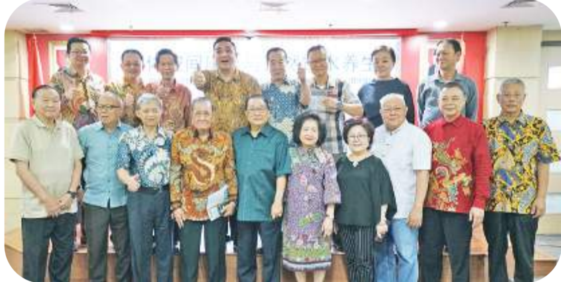
健康讲座结束后宾主合影留念。