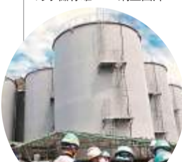
◆福島第一核電站的核污水儲存罐。