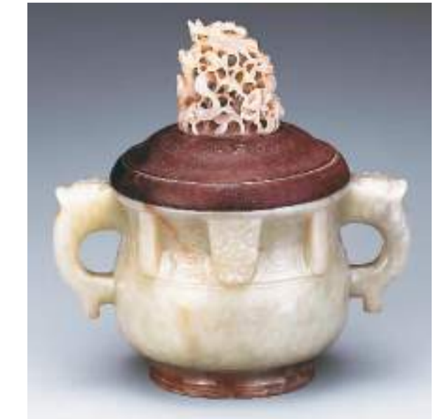
▲明代兽面纹双兽耳罐。

第五单元“缕冰雕琼”从材料和工艺角度介绍玉石知识和治玉技术发展。绚丽多彩的清代“福祿寿”百宝嵌饰令人啧啧赞叹。百宝嵌又称“细嵌”，以金、银和各色宝石、珊瑚、蜜蜡、象牙、螺钿、沉香、砗磲等材料，制成山水、人物、楼台、花卉、鸟兽等形象，再镶嵌在漆木器之上，色彩艳丽，精美绝伦。