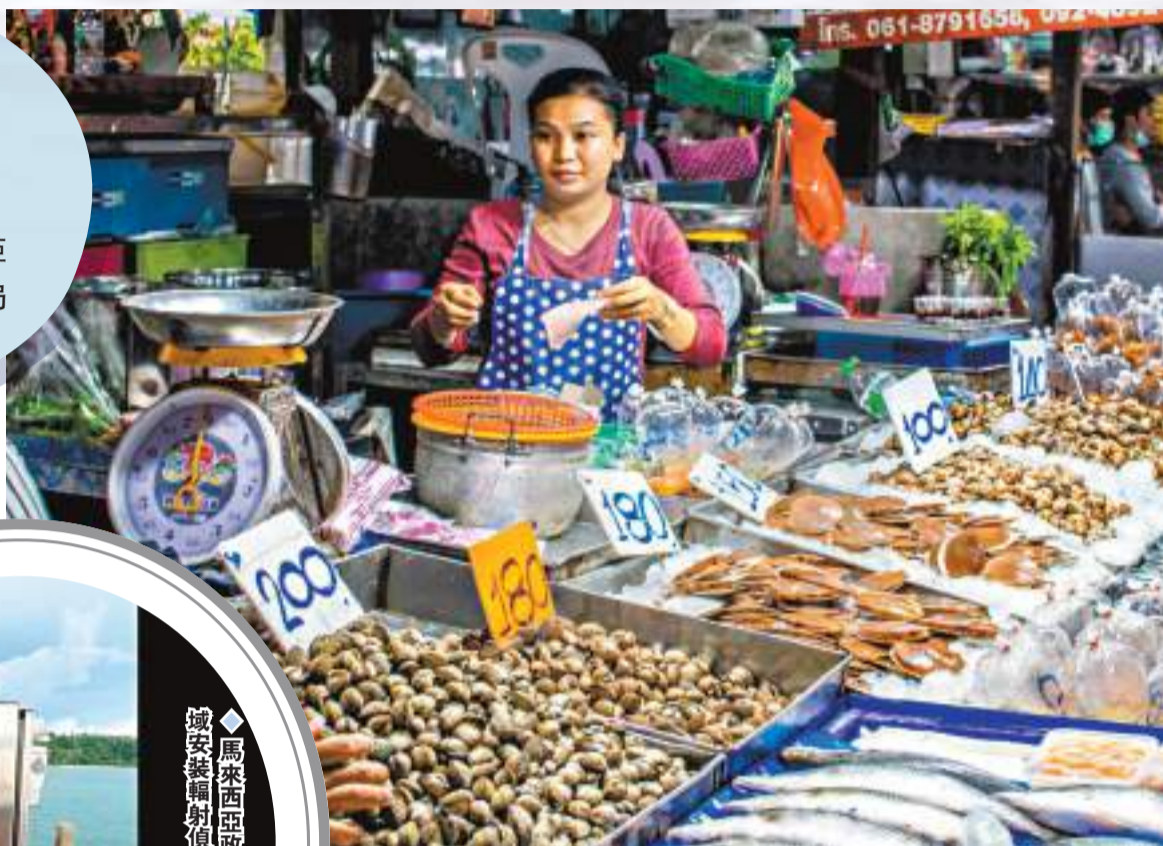
◆泰國消委會呼籲泰國當局嚴查進口日本水產品。圖為泰國水產攤檔。

大馬科學、工藝及革新部長鄭立棟表示，針對日本政府排放核污水入海，大馬已在靠近菲律賓的東馬沙巴海域安裝了輻射偵測儀，其餘位置也會增設4部類似儀器。鄭立棟稱，大馬政府非常關注核污水排海，了解民眾的擔憂，局方已透過轄下大馬原子能局在海域安裝「多光譜水質監測系統」，檢測當地海域水質。