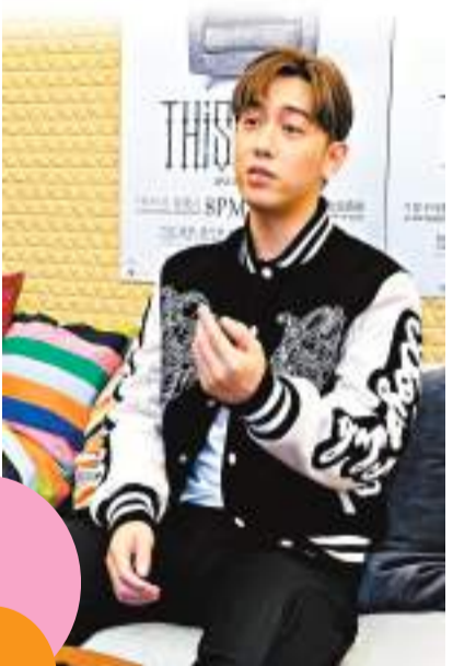
MC指今次首個海外個唱會注入澳門元素。