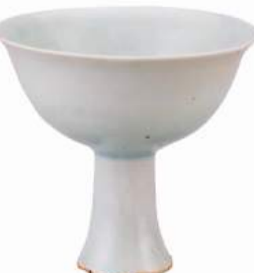
▲卯白釉印花“王白”铭高足杯，首都博物馆藏。

元武宗至大三年(1310年)，赵孟頫又奉诏北上大都，途中从独孤長老处得到五字已损本《定武兰亭