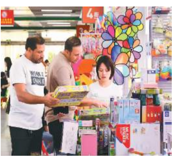
连日来，浙江省金华市义乌国际商贸城顾客盈门，络绎不绝的国内外客商和游客纷至沓来，洽谈、交易十分红火。图为8月27日，外商正在义乌国际商贸城内洽谈、采购小商品。

新华社北京8月28日电 (记者温馨、袁帅)外交部发言人汪文斌28日在例行记者会上说，自2023年8月30日起，来华人员无需进行入境前新冠病毒核酸或抗原检测。