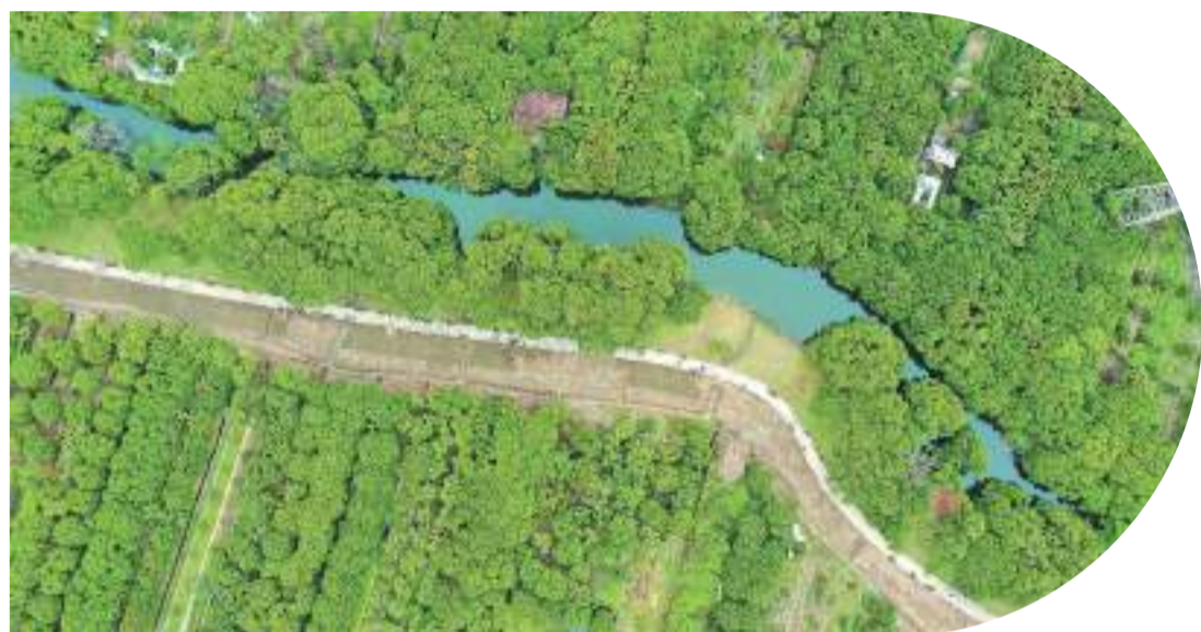
我市堅持生態優先、綠色低碳、人水和諧，打造山水詩畫生態韻城。圖為市區延壽西溪下游，一條新修建的綠道沿溪岸向前蔓延，成為市民休閒健身新去處。

在保護綠色生態上下功夫，建設“生態好”先行市；在發展綠色產業上下功夫，建設“產業優”先行市；在建設綠色城鄉上下功夫，建設“城鄉美”先行市；在增進綠色福祉上下功夫，建設“百姓富”先行市