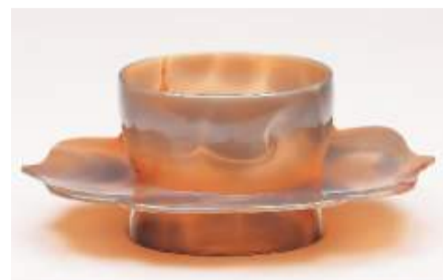
▲唐代玛瑙花瓣盘托。

第二单元“玉礼堂堂”展现了西周至汉晋时期玉器的发展脉络，分为“玉以载礼”“以玉比德”“灵魂不朽”3组。在这一单元可以看到造型多样的玉佩饰，如西周人龙纹璜、春秋时期玛瑙玉组佩、战国时期夔龙形佩、西汉舞人佩等。组佩指的是西周以后逐渐形成的全身佩戴或悬挂腰间的佩玉组合，以牌、璧、珩、璜、环为主体，以黼、管、珠、冲牙、动物形饰等为配件。组佩是周礼制度的物化表现，佩饰的材质、架构、长短成为区别身份地位的重要标志。地位越高的人组佩的长度越长，结构越复杂。组佩系在身上，行路时可当作响，还有节步作用，彰显主人的从容气质和优雅风度。殓葬玉器也是一种重要的玉器类型。云南晋宁石寨山遗址出土的西汉玛瑙扣饰背面有双孔，通过丝线可与各种珠管连缀成一幅“珠被”覆盖在死者身上，是古滇国仿效中原王室葬仪制作的“珠襦玉珥”。