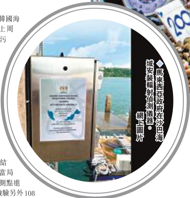
◆馬來西亞政府在沙巴海域安裝輻射偵測儀器。

韓國政府28日宣布實施為期100天的第二次官聯合進口水產品原產地標記特別檢查工作，將銷量較大的進口帶子和紅鯛魚等作為重點檢查項目，涵蓋全韓約2萬間進口水產品企業。海洋水產部次官朴成訓表示，今次檢查較今年早前首次特別檢查時間更長，當局會對每間企業登門檢查3次以上。