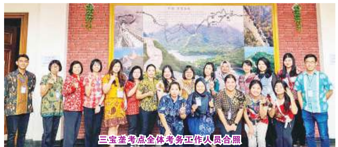
三宝垄考点全体考务工作人员合照