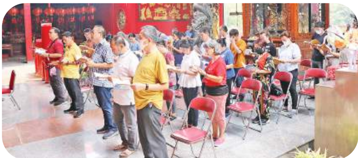
僧侣和信徒在祈祷仪式进行时