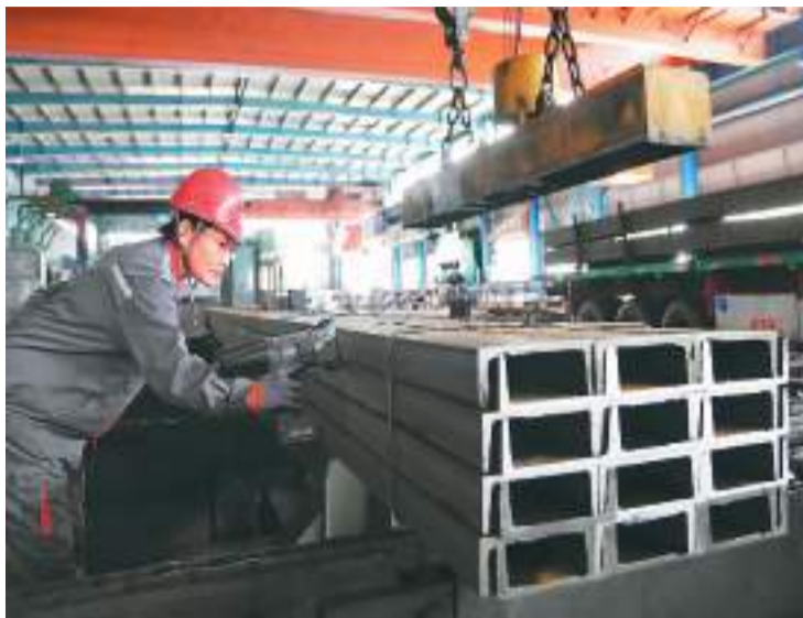
近年来，河北省唐山市丰润区持续淘汰落后钢铁产能，推动钢铁产业向精深化、高端化转型，建设环保型绿色工厂，发展高附加值、高竞争力的精品钢产品，助推经济绿色发展。图为唐山市丰润区一家钢铁企业的工人在给刚下线的槽型钢喷码。

工信部原材料工业司副司长邢涛说，今年以来，石化化工行业努力稳生产、优结构、促转型，化工新材料和精细化学品发展潜力不断释放。《石化化工行业稳增长工作方案》从促投资、优供给、稳外贸、保生产、强企业等5方面提出11