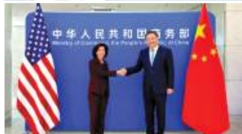
▲8月28日，中國商務部部長王文濤在京與來訪的美國商務部長雷蒙多舉行會談。