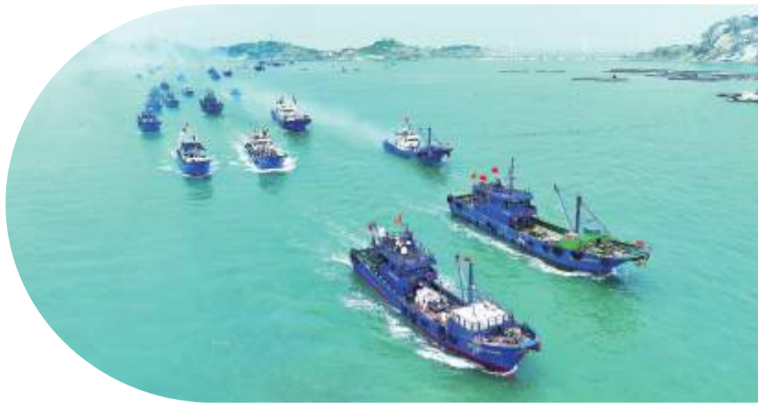
8月16日，福建省首屆開海文化季（莆田分會場）活動在南日鎮浮葉一級漁港舉行。圖為漁港碼頭排列整齊的漁船，鳴笛列隊出海，場面壯觀。

（莆田網訊）8月16日上午，由省文化和旅游廳、省海洋與漁業局、莆田市人民政府主辦的“福見揚帆 漁海同樂”福建省首屆開海文化季（莆田分會場）暨2023年秀嶼·南日島漁業態推介會在南日鎮浮葉一級漁港舉行。