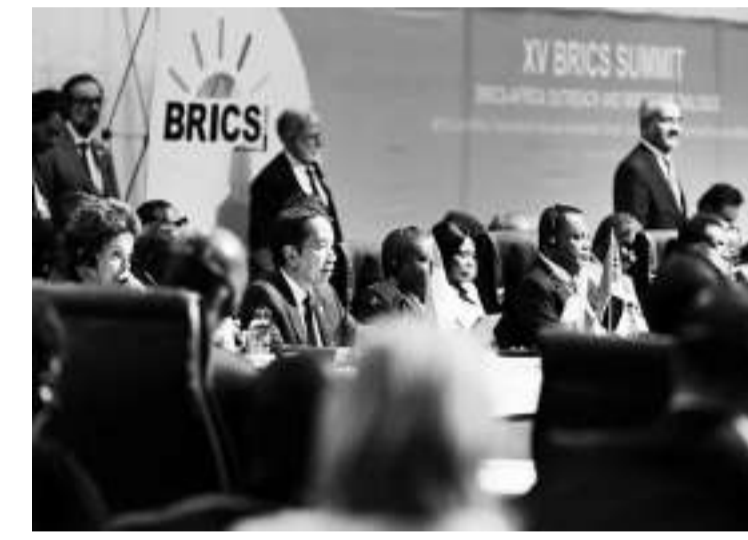
佐科维总统出席金砖国家峰会。

们对它们参与地缘政治联盟的长期担忧，以及对成员资格将带来的经济利益的不确定性。 半岛电视台援引印尼艾朗卡大学国际关系教授、政治观察家拉迪约(Radityo Dharmaputra)的话说，印度尼西亚是东南亚人口超过2.7亿的国家之一。印度尼西亚是一个发展中国家，根据一些估计，到本世纪中叶，印度尼西亚可以列入世界上拥有最大经济体的五个国家之中。这并不太令人惊讶，因为许多分析人士和外交官警告不要加入金砖国家，其经济利益并不明确和切实，而西方反应的政治和经济影响是相当确定的。印尼被视为与中俄靠得太近的形象是一个问题。此外，印度尼西亚高度重视其独立和自主的外交政策。当其他国家与中国和俄罗斯处于同一集团时，印尼将如何向其他国家提供建议呢？ 还有人提到印度尼西亚是如何作为不结盟运动的创始成员之一的。该组织在冷战期间积极保持中立，坚持