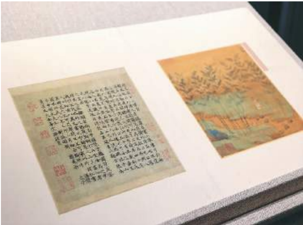
▲赵孟頫《自写小像》，故宫博物院藏。

元大都建筑设计受到草原文化逐水而居的影响，皇宫环列于太液池(今北海)和琼华岛(今北海白塔山)的东西两岸，琼华岛上建有一座广寒殿。首都博物馆藏嵌螺钿广寒宫图漆器残片出土于元大都后英房遗址，上有“广”字残迹，一般被认为表现的是琼华岛上的广寒殿。画面以螺钿镶嵌而成，色泽变化丰富，正中一座两层楼阁，一道云气自楼阁下层腾起，掠过楼顶，直冲霄汉。这是迄今发现年代最早的平脱薄螺钿器物，也是目前出土的唯一元代螺钿漆器，证明元代已出现薄螺钿镶嵌工艺。