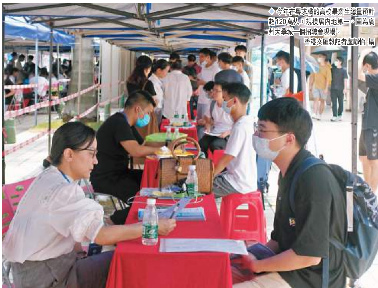
◆今年在粵求職的高校畢業生總量預計超120萬人，規模居內地第一。圖為廣州大學城一個招聘會現場。