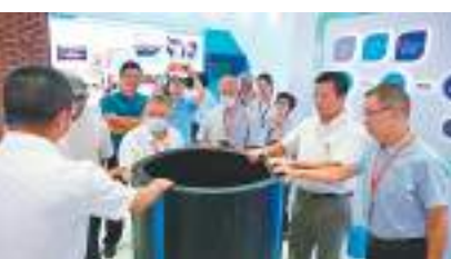
◆金門鄉親在龍湖泵站參觀金門供水工程所用管道。