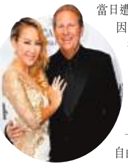
◆Bruce指與李玟一起20年，沒有一段關係是百分百完美的。