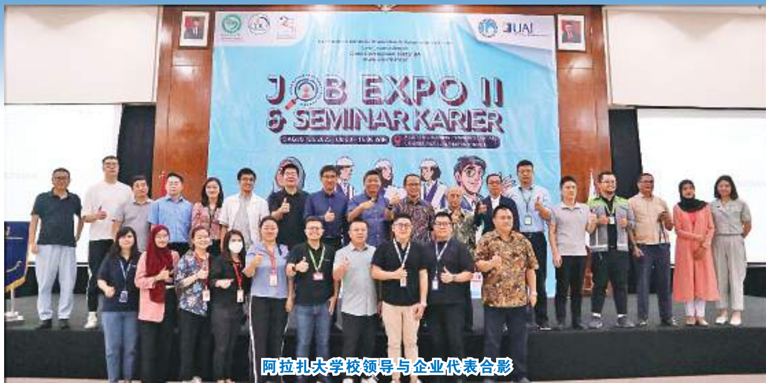
阿拉扎大学领导与企业代表合影

【本报讯】8月5日，印尼阿拉扎大学孔子学院在阿拉扎大学三楼礼堂再次举办企业招聘会，旨在搭建好印尼高校与企业之间的就业招聘平台，深化校企合作，服务印尼企业。参加本次招