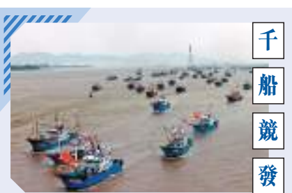
8月6日，浙江省舟山市普陀區大批漁船奔往東海開捕。