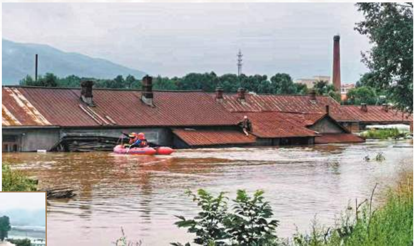
▲黑龍江尚志市遭遇1957年以來最大強降雨。

尚志市應急管理局工作人員稱，4日已有救援物資送往一面坡受災村莊，通訊也在搶修中。同時，尚志市商務局相關負責人亦表示，已第一時間組織供水設施排查，通過派出消防車運送飲用水和瓶裝礦泉水的方式，確保受災群眾應急安全飲水，並合理調運了相關物資。