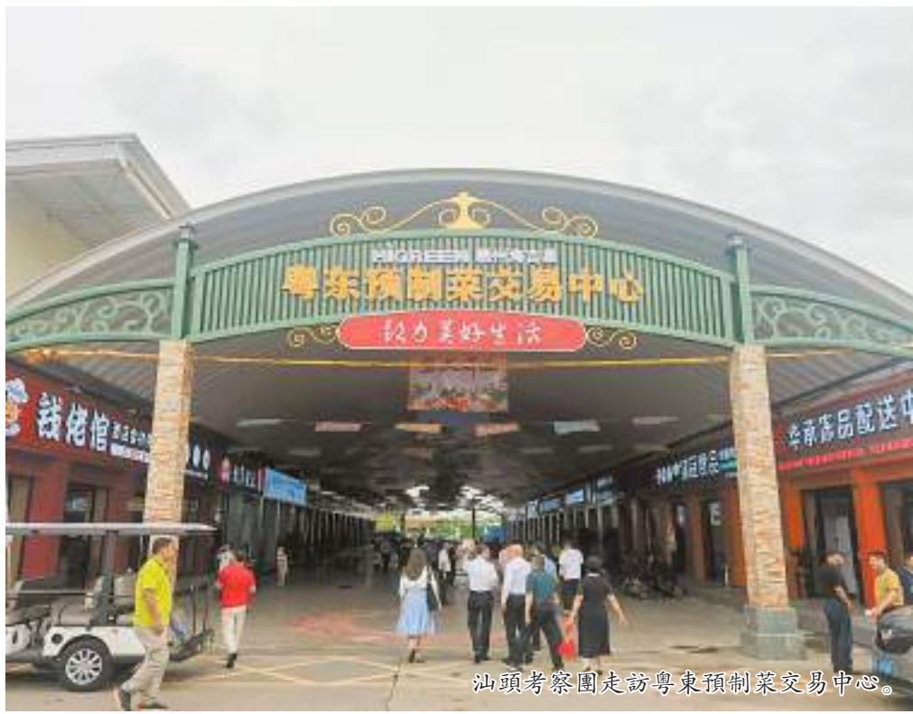
汕頭考察團走訪粵東預製菜交易中心。

惠州之行，大多企業對汕頭預製菜進駐惠州表示濃厚的合作意向，希望借此良機，深入開展進駐直銷、品牌代理、委托加工、新品首發等多種形式的合作，推動汕頭預製菜走進大灣區、走向全國乃至東南亞地區。惠州市相關企業表示，汕頭美食聞名海內外，兩地發展預製菜產業潛力無限，將充分發揮資源專業優勢，依托深農集團全國市場布局，彰顯航母級交易平臺的網絡覆蓋度和市場滲透力，為廣大預製菜廠家及代理商提供供應鏈綜合服務，從而實現優勢互補、發展共贏，共同助力預製菜產業高質量發展。