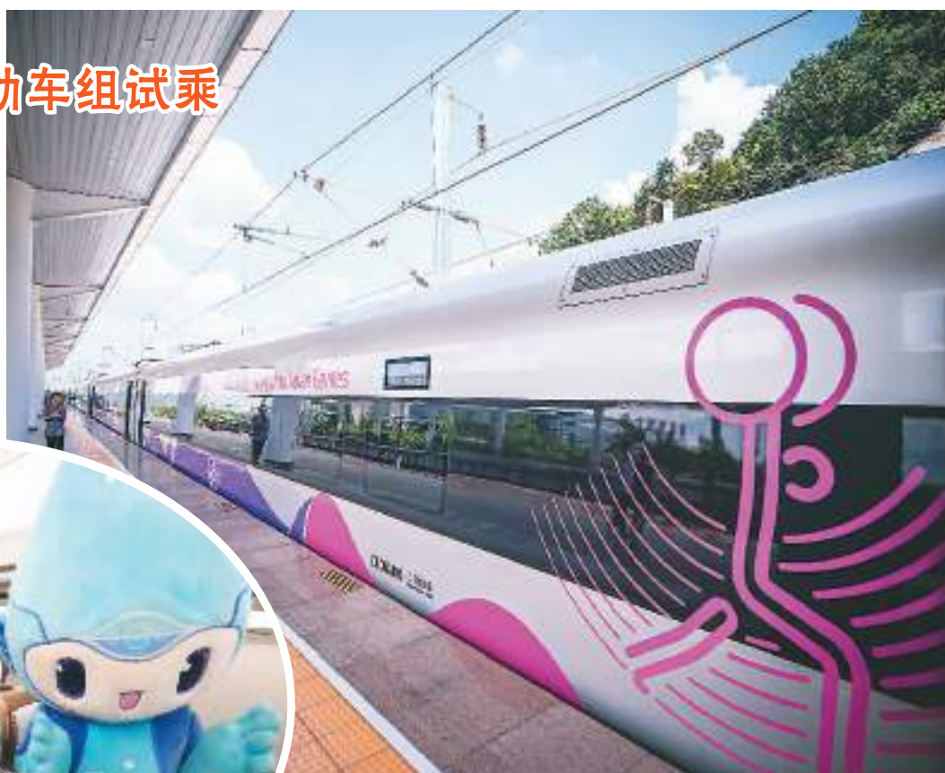
上图：8月4日，复兴号亚运智能动车组停靠在德清站站台。 左图：8月4日，乘组人员在列车上与杭州亚运会吉祥物合影留念。

8月4日，由浙江交通集团购置、为杭州第19届亚运会量身定制的复兴号亚运智能动车组搭载近百名乘客从杭州西站出发，在合杭高铁湖杭段开启首次试乘活动。复兴号亚运智能动车组采用杭州亚运会主形象色“虹韵紫”涂装，针对浙江多丘陵山地的地形特点采用定制化的技术创新方案，将在杭州亚运会赛事期间承担重要的交通转运功能。