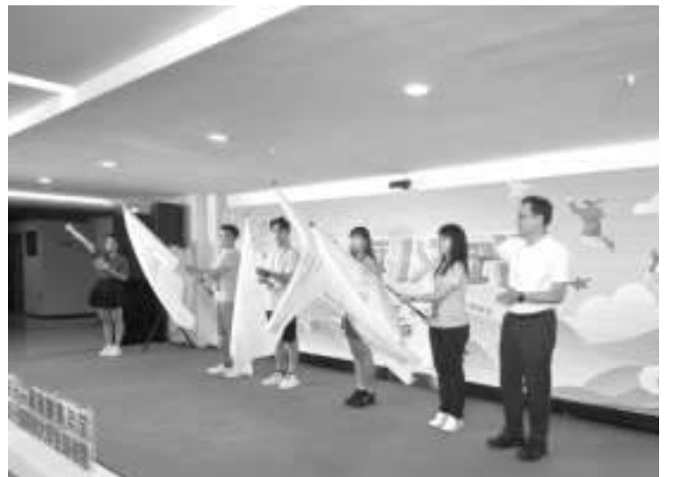
6日,第七届两岸大学生领袖营在福州开营。

台湾媒体人黄扬明5日晚也在脸书发文称,每任台湾地区领导人面临的经济情势、税制、财政状况可能不同,直接对比并不公平,重点不在债务是否增加,而是钱有没有花在刀刃上。黄扬明表示,“如果抱持的想法是,反正没到举债上限,只求平安卸任,那么债留子孙自然而然会成为常态。”