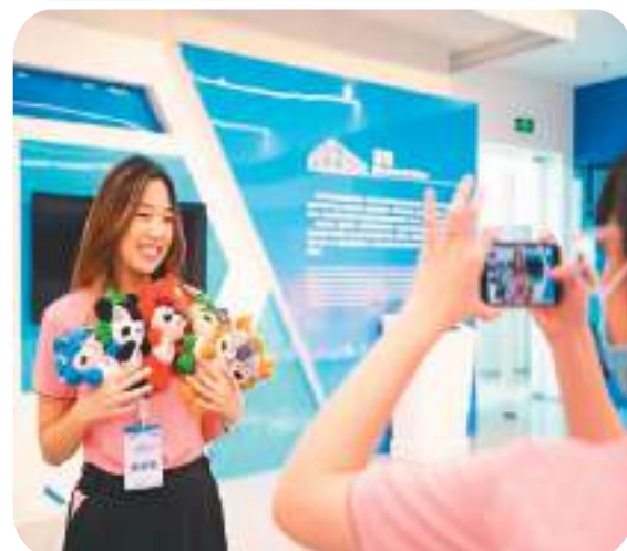
▼ 台胞青年在国家游泳中心拍照。

全国台联联络部部长任挥表示，希望台胞青年通过本次行程，感受中华文化的博大精深，深入体验风土人情和历史文化，也期望各位营员能把在大陆客观真实的体验和感受带回在国，与当地同胞，特别是海外台胞分享，让更多人了解大陆，了解大陆青年。