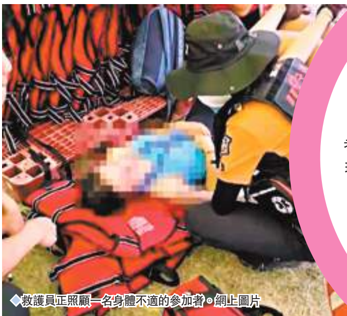
◆救護員正照顧一名身體不適的參加者。

香港文匯報訊 四年一度的世界童軍大露營本月在韓國舉行，來自158個國家和地區約4.3萬人參與，然而主辦方韓國夏季氣溫飆升至攝氏38度，營地設施和後勤資源亦嚴重不足，數以千計參與者中暑求醫，網民更戲稱活動如同講述參加者需玩遊戲求生、敗者將面臨淘汰的韓劇《魷魚遊戲》。規模龐大的英國和美國童軍代表團近兩日先後決定拔營。香港童軍總會5日表示，香港代表團成員健康安全，目前暫不考慮離營，但團隊會在有需要時啟動應變措施。