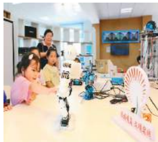
暑假期间，各地青少年参加丰富多彩的活动，乐享假期生活。图为8月4日，在山东省青岛市西海岸新区黄岛街道前湾社区科普馆，青少年在观看编程机器人跳舞。

据新华社上海8月4日电（记者贾远理）8月4日，东航接收的两架国产大型客机C919首次开启“双机商业运营”，同日共同执行“上海虹桥—成都天府”航线。C919的商业运营稳步向规模化迈进。 两架C919飞机当日共同执飞东航沪蓉快线，往返航班号分别为MU9197/MU9198和MU9189/MU9190。按计划，每逢周一、周三、周五、周日，东航的两架C919飞机将在上海虹桥—成都天府之间执行4个航班；其他时间，每天执行2个航班。 2022年12月9日，东航作为全球首发用户，正式从中国商飞公司接收全球首架C919飞机。2023年5月28日，东航圆满完成C919首个商业航班“上海虹桥—北京首都”的往返飞行，此后首架C919在沪蓉快线上服务旅客。截至2023年7月31日，首架C919共执行商业航班125班次，累计商业运营360.32小时，累计服务旅客超1.5万人次。2023年7月16日东航正式接收第二架C919飞机，商业运营稳步推进。