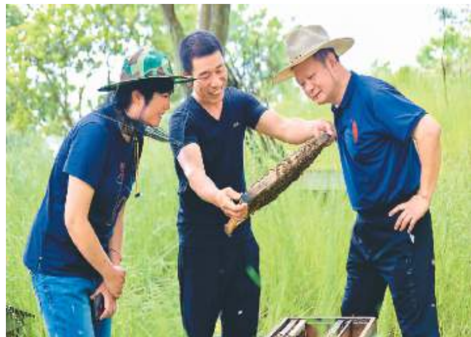
浙江省温州市泰顺县科技特派员（右）在百花蜂蜜基地进行技术指导。