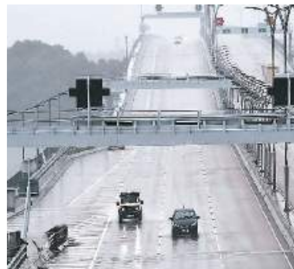
香港本地单牌车行驶在港珠澳大桥香港段。

最后，祝您顺利申办，尽早享受“港车北上”政策红利，并祝您在广东驾车旅途愉快！（拱北海关所属港珠澳大桥海关关员 雷涌锋）