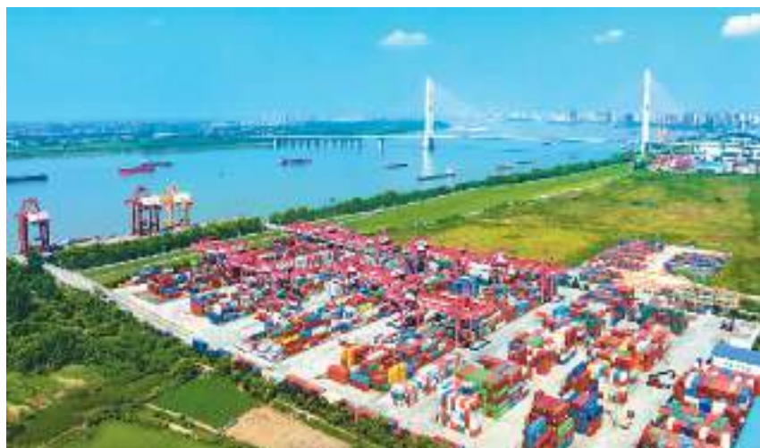
八月四日，位于国家级九江经济技术开发区的上港集团城西港区集装箱码头一艘艘货轮在码头的泊位上有序装卸集装箱，现场呈现一派繁忙景象。

《通知》要求，进一步发挥绿证在构建可再生能源电力绿色低碳环境价值体系、促进可再生能源开发利用、引导全社会绿色消费等方面的作用。推动中央企业、地方国有企业、机关和事业单位发挥先行带头作用，稳步提升绿证消费比例。强化高耗能企业绿证消费责任，按要求提升绿证消费水平。支持重点企业、园区、城市等高比例消费绿色电力，打造绿色电力企业、绿色电力园区、绿色电力城市。