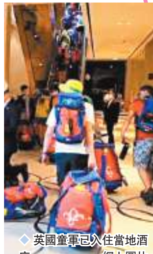
◆英國童軍已入住當地酒店。網上圖片

英媒《每日郵報》引述匿名志願者消息稱，「我認識的人都說在當地經歷了一場噩夢，營地沒有足夠的醫療設施，也沒有招募足夠的醫生。相較4年前在美國舉行的大露營，當時主辦方提供了更多的遮蔭場所，食物和食水也供應充足，一切都較今次更好。」報章還披露，許多英國家長都擔心參加露營的子女是否安全，更有家長稱孩子向他們訴苦「感覺快要死了。」匿名志願者也批評韓國主辦方後勤不力，「總統不應該到了已經一個晚上就有600人中暑暈倒的地步，才說會為大家提供更多的冷氣巴士。」