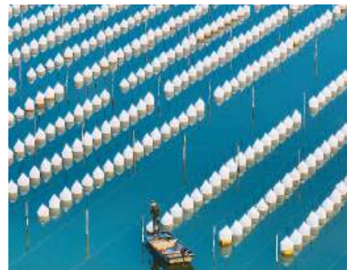
山东省济宁市微山县近年来依托当地丰富的水资源优势，大力发展绿色生态水产养殖，促进当地渔民增收致富。图为8月3日，微山县爱湖村水产养殖基地，渔民正在对池塘进行养护。