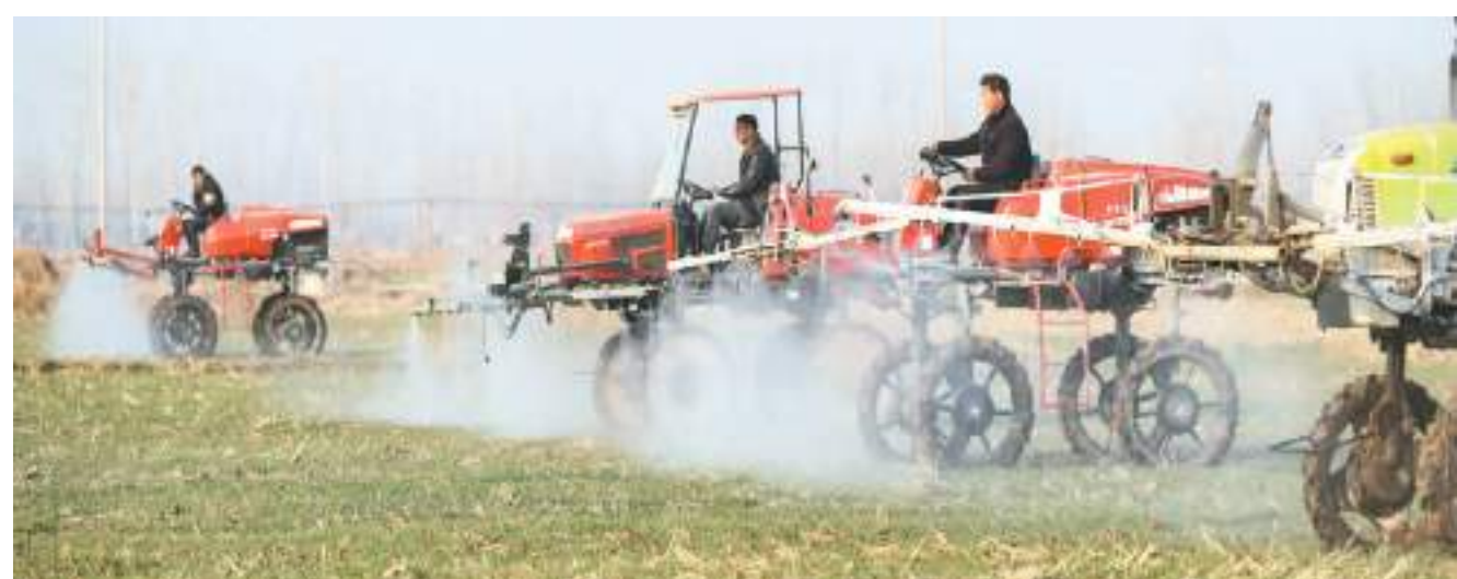
江苏省淮安市农业技术推广中心科技特派员指导种粮户进行农业机械作业。