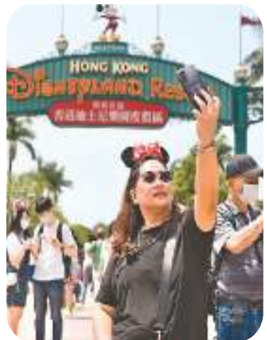
▲ 游客在香港迪士尼乐园度假区自拍留念。