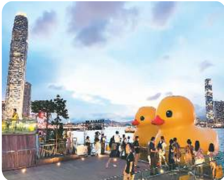
▲ 今年6月，游客在香港中环海滨拍摄“大黄鸭”。

此刻的香港，“个人游”旅客依旧遍布街道，他们在深水埗的大排档露天而坐，感知港式街边风味；在西九文化区，漫步于香港故宫文化博物馆，感受中华传统文化艺术的博大精深和源远流长；去油麻地警署、半山扶梯，打卡港剧同款取景地……精细化、个性化的旅游线路打开香港旅