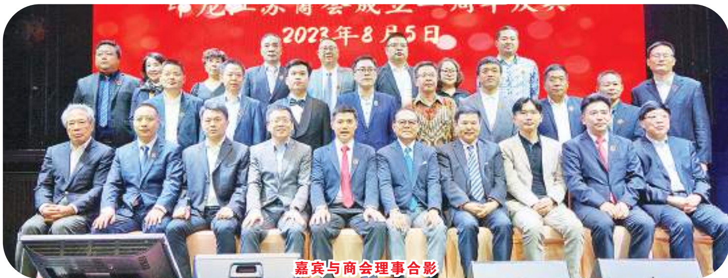
嘉宾与商会理事合影

致词完毕,理事嘉宾贤来宾敬酒,并举行切蛋糕仪式。庆会在充满温馨的氛围中落下帷幕。