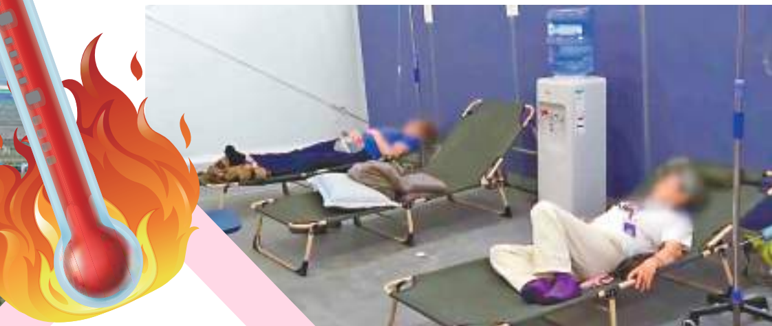
◆多人被送往急症室吊鹽水。