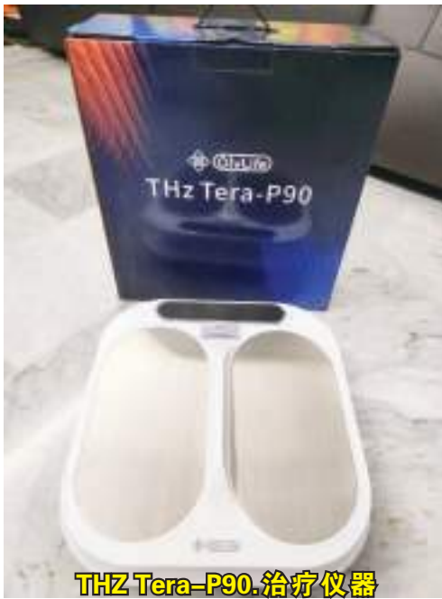
THZ Tera-P90 治疗仪器