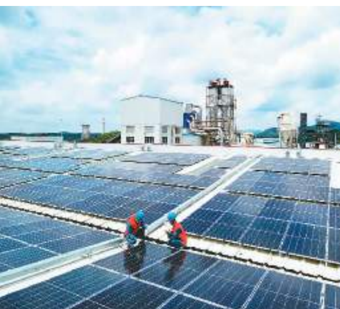
广西壮族自治区钦州市近年来大力发展风力、光伏等绿色发电项目，以清洁能源促进区域新发展。目前，新能源项目并网规模达326.94万千瓦，近3年新能发电量82.26亿千瓦时，发电量年均增长率达50%以上。图为南方电网广西钦州供电局工作人员对屋顶光伏电站开展安全巡检服务。

“锂离子电池储能仍占绝对主导地位，压缩空气储能、液流电池储能、飞轮储能等相对成熟的储能技术保持快速发展，超级电容储能、固态电池储能、钛酸锂电池储能等新技术也已经开始投入工程示范应用，各类新型储能技术发展你追我赶，总体呈现多元化快速发展态势。”刘亚芳说，目前，国家能源局正在组织开展电力领域综合性监管。新型储能项目运行调度、市场交易等情况已纳入重点监管内容，推动新型储能等调节性资源更好地发挥作用，促进风光等可再生能源大规模开发消纳，保障电力安全稳定供应。