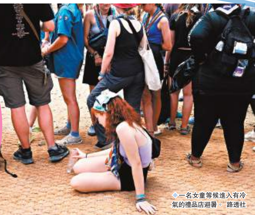
◆一名女童等候進入有冷氣的禮品店避暑。

香港文匯報訊 四年一度的世界童軍大露營本月在韓國舉行，來自158個國家和地區約4.3萬人參與，然而主辦方韓國夏季氣溫飆升至攝氏38度，營地設施和後勤資源亦嚴重不足，數以千計參與者中暑求醫，網民更戲稱活動如同講述參加者需玩遊戲求生、敗者將面臨淘汰的韓劇《魷魚遊戲》。規模龐大的英國和美國童軍代表團近兩日先後決定拔營。香港童軍總會5日表示，香港代表團成員健康安全，目前暫不考慮離營，但團隊會在有需要時啟動應變措施。