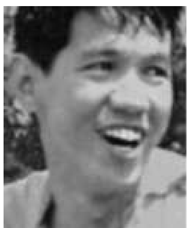
史福义(Soe Hok Gie)

美联储主席鲍威尔近期也坦承美国中小银行深受危机打击,联储副主席巴伯尔近期则提出要提高对美国大银行的风险资本条件