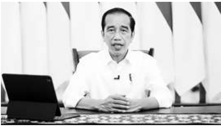
佐科维公布总统条例结束新冠肺炎大流行的处理工作。

【本报讯】佐科维总统发布了关于结束处理新冠肺炎大流行的2023年第48号总统条例，同时也解散了处理新冠肺炎和国家经济复苏委员会。佐科维于2023年8月4日签署了一项由六条规定组成的总统条例。总统条例第2条指出，根据这项总统条例，处理新冠肺炎病毒与国家经济复苏委员会被宣