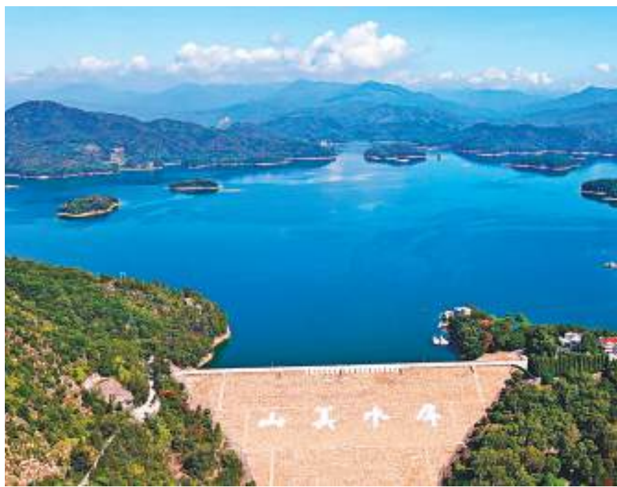
◆金門供水工程水源地——泉州山美水庫。

香港文匯報訊 綜合新華社及香港文匯報記者蔣煌基報道，福建向金門供水工程通水五周年活動5日在福建晉江市舉行。