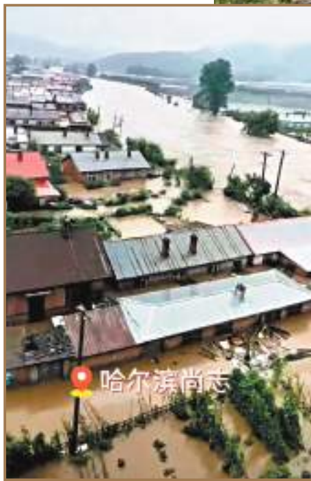
◆黑龍江尚志市房屋被淹。 視頻截圖