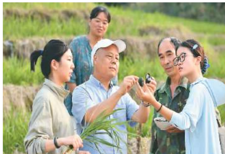
福建农林大学研究生跟随省级科技特派员调研稻螺种养模式。