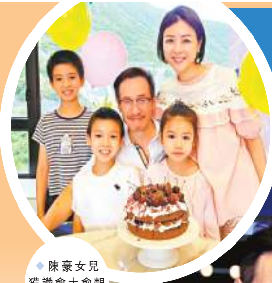
◆陳豪女兒獲讚愈大愈靚女。