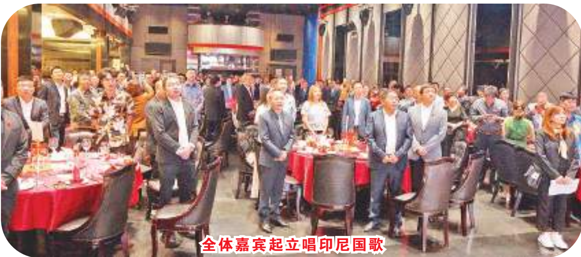
全体嘉宾起立唱印尼国歌