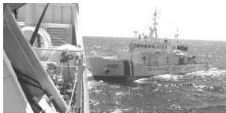
8月5日,菲2艘运补船和2艘海警船未经中国政府批准,非法闯入中国南沙群岛仁爱礁邻近海域。中国海警依法实施必要管控,对菲搭载违规建材的船只进行了拦阻。

据介绍,山东省德州市消防救援支队15车、107人已前往震中救援。济南、泰安、聊城、德州、滨州等5个消防救援支队24车、236名消防救援人员以及搜救犬机动专业支队已集结完毕。