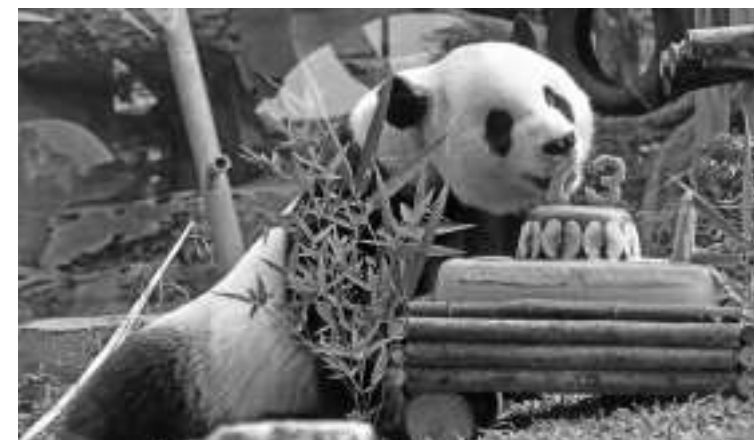
大熊猫彩陶欢度13岁生日 西爪哇省茂物县芝沙鲁瓦沙华丽野生动物园,大熊猫“彩陶”正在吃红萝卜,今年8月5日适逢彩陶13岁生日。

最高,即同比增长了8.3%。今年六月份第三方存款,同比增长了5.79%或达到8042万亿盾,其中储蓄存款同比增长2.97%为最低。 蒂安说:“金融服务权威机构以保持融资增长和流动性之间的平衡,一直推动银行业的绩效表现。”