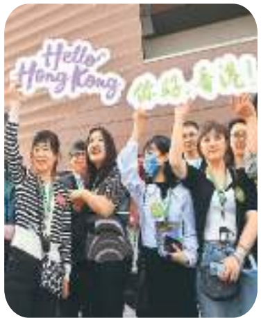
▲ 内地旅游者在香港故宫文化博物馆前合影。

今年2月香港与内地全面恢复通关以来，“港人北上”消费旅游成为新热潮。香港特区政府入境事务处数据显示，6月北上港人总数超过408万人