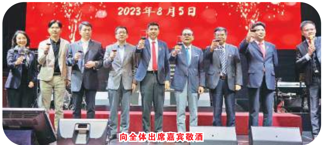
向全体出席嘉宾敬酒