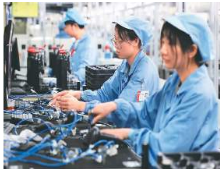
近年来，福建省福州市仓山区持续推进科技创新的税费优惠政策扎实落地，更好激发各类创新主体创新创造活力，为当地经济高质量发展提供坚实支撑。图为工人在仓山区一家科技企业生产车间内赶制订单产品。

袁达分析，从经济运行的最新数据看，实物量指标增速加快，7月份全国规模以上工业增加值同比增长5.9%，较上月加快1.5个百分点；市场预期有所好转，制造业采购经理指数已连续2个月回升。“随着‘组合拳’各项政策效果不断显现，下半年经济将在上半年持续恢复的基础上，保持稳定向好态势。”袁达说。