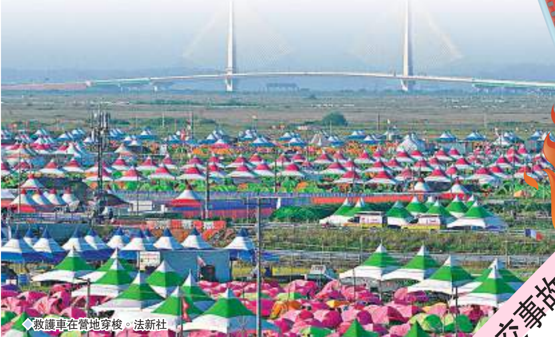
◆救護車在營地穿梭。

一名中暑的活動參與者在社媒Instagram（Ig）上透露，「我所在的急症室面積只有首爾連鎖咖啡店一半，床位明顯不夠，只能在通道上輸液。我還看見不斷有昏倒的外國人送進來，這又沒有發生戰爭，我還以為我身處戰區呢。」