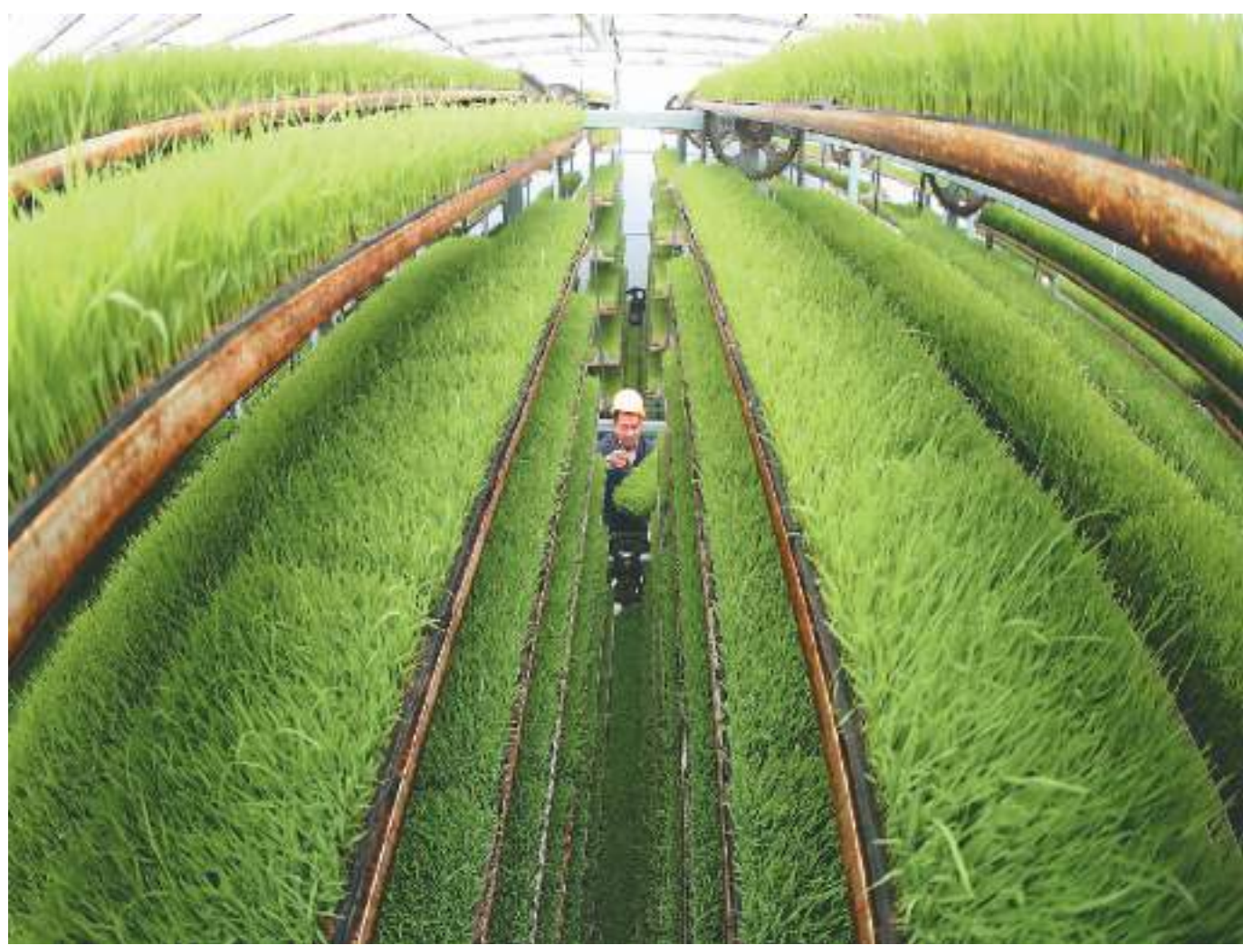
在湖南省衡阳市衡东县大浦镇机械集中育秧中心，科技特派员在查看早稻育秧生长情况。