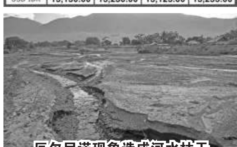
厄尔尼诺现象造成河水枯干 气象局预计,厄尔尼诺现象将在今年8月至9月达到顶峰,因此会造成严重干旱,奉劝大家在此期间要节省用水。

成为卫生社会保障机构(BPJS Kesehatan)会员,他们的医疗费也都是使用税收缴付的,所以说税收的确有很多好处。 她强调说,纳税是国家要实现其目标的工具之一,这样才能创造一个公平、富裕和幸福的印度尼西亚,当然国家要通过税收、关税收入和非税收入,才能为国为民提供建设服务。(Sm)