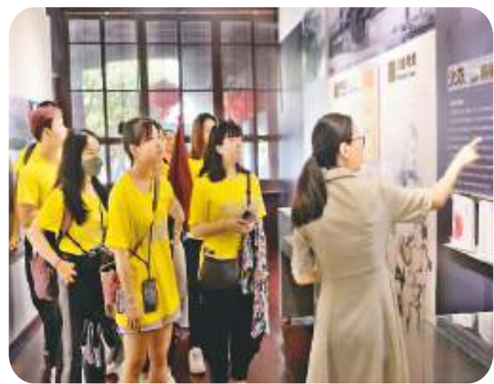
▲ 两岸青年参观琦君文学馆。

本次活动由温州市瓯海区人民政府和温州市台办主办，瓯海区台办承办。据主办方介绍，自2011年以来，琦君文化节已连续举办十二届，每期活动紧扣琦君相关主题，吸引了众多两岸青年参与。当地还通过打造琦君文学馆和纪念馆、设立琦君散文奖、举办琦君研究高峰论坛等方式，让琦君和她笔下的故乡走进更多人的心里。