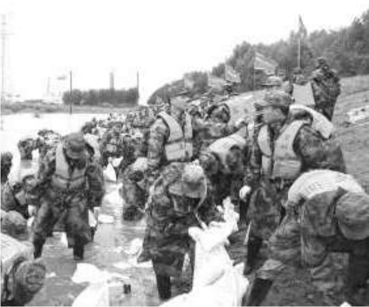
8月5日,陆军第78集团军某旅官兵在黑龙江齐齐哈尔市碾子山区地域加固岸堤。