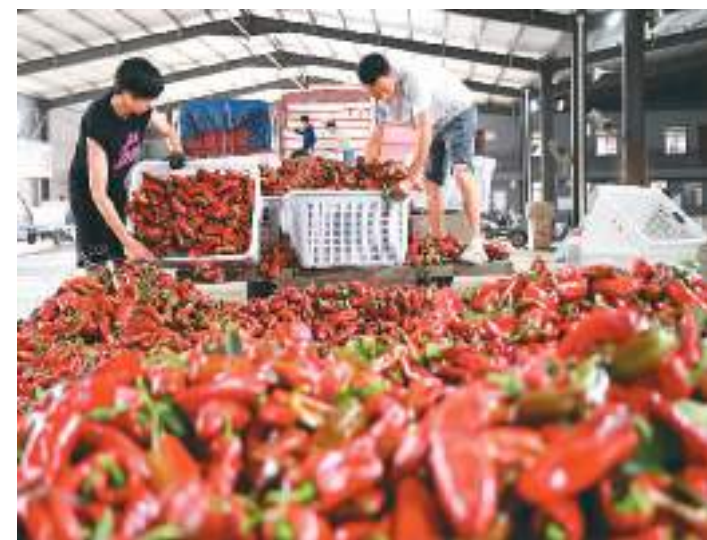
近日，安徽省蚌埠市五河县朱顶镇陈台村的3000余亩辣椒迎来收获季，村民们忙着采摘、搬运、装车，一派喜人的丰收景象。近年来，朱顶镇采取“合作社+农户+市场”的模式，结合市场需求种植特色辣椒品种，带动当地农民增收致富。图为五河县朱顶镇陈台村村民将采摘的辣椒运送到仓库。

据了解，此次峰会由辽宁省人民政府和中华全国工商业联合会主办，参会企业中有2022年度中国民营企业500强70家。