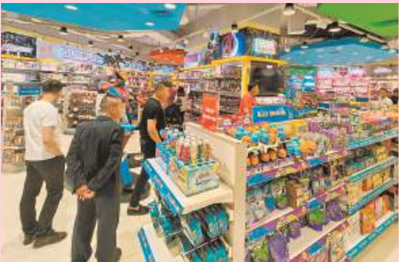
澄海玩具協會經貿代表團考察參觀東南亞玩具賣場。

7月中旬，汕頭市委書記溫湛濱率汕頭市友好代表團赴泰國、印度尼西亞和新加坡，對接深化經貿交流合作，推介汕頭投資創業環境，促成多個產業項目和戰略合作協議簽約，達成合作項目37個，總金額208億元。東南亞之行是汕頭以“僑”為橋，用心用情創新舉措做好新時代“僑”的文章，講好汕頭故事的務實之舉，抓住“一帶一路”建設和RCEP生效實施重大機遇，進一步拓寬經貿合作渠道，促進汕頭與泰國、印尼、新加坡進出口貿易和雙向投資實現高質量發展的長遠之舉。