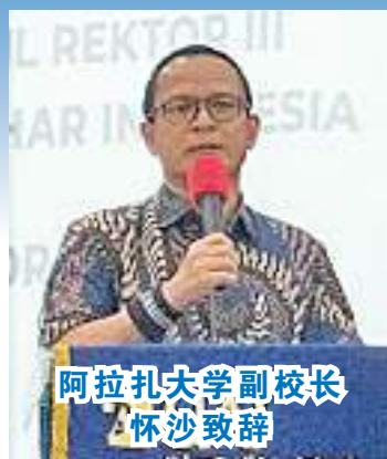
阿拉扎大学副校长怀沙致辞