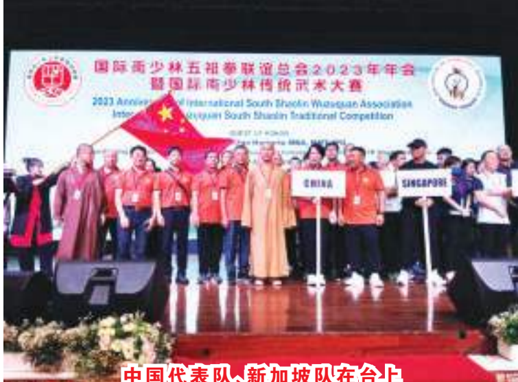
中國代表隊、新加坡隊在台上