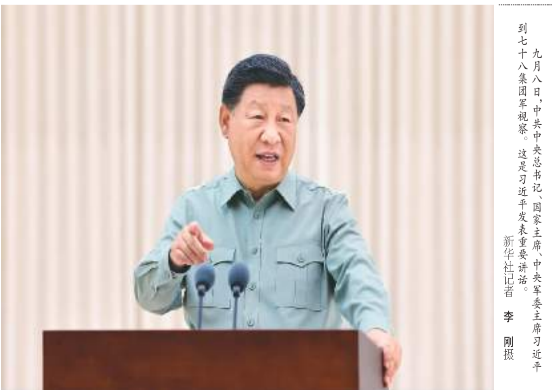
九月八日,中共中央总书记、国家主席、中央军委主席习近平到七十八集团军视察。这是习近平发表重要讲话。