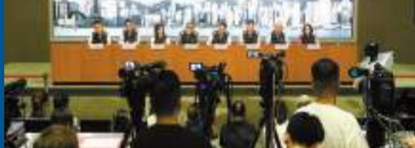
特區政府昨午召開跨部門聯合記者會，簡報市面復修情況。