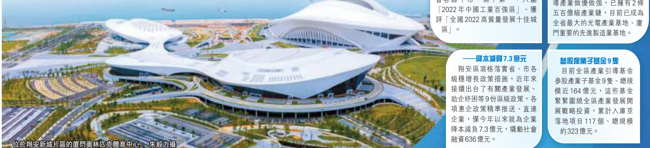
位於翔安新城片區的廈門奧林匹克體育中心。

目前全區產業引導基金參股產業子基金9隻、總規模近164億元，這些基金緊緊圍繞全區產業發展開展戰略投資，累計入庫並落地項目117個、總規模約323億元。