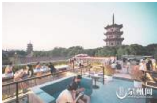
泉州文旅集團合理活化利用老建築,推動街區業態升級,做到“見人見物見生活”,獲得了良好的社會效益。