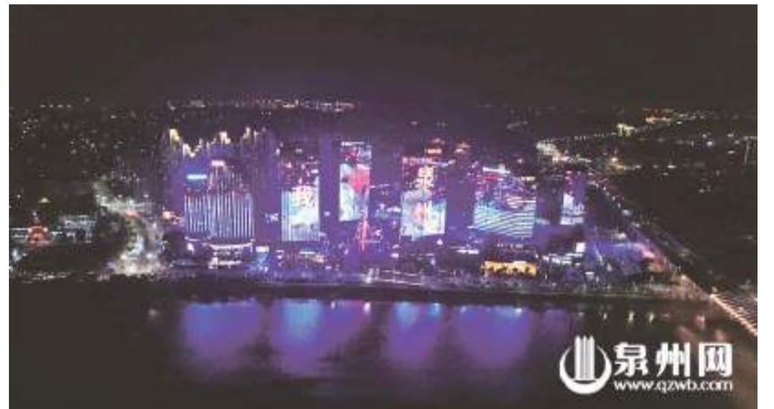
泉州城建集團投資建設的晉江、洛陽江兩岸照明提升工程全面點亮,泉州再現“光明之城”盛景。

泉州網訊(記者黃嘉琳)完善公共交通配套、引進潮流商業綜合體、打造親子人工沙灘、提升園林綠化管理、發展濱海夜市經濟、舉辦音樂節烟花秀……市民建設宜居宜業東海的願望,也是泉州做大做強中心城區、打造一流環灣主城區的落腳點。8月中旬,由泉州市中心市區城建總指揮部、泉州市住房和城鄉建設局主辦,泉州市城市建設發展中心、泉州城市更新中心、泉州城建集團、泉州文旅集團、泉州水務集團協辦,泉州晚報社承辦的“潮涌東海 聚力‘耕’新”金點子徵集活動正式啓動,僅僅兩周時間,就收到了近三百條誠意滿滿的建議、期望和感想,彰顯了市民對進一步繁榮發展東海的情緒和信心。