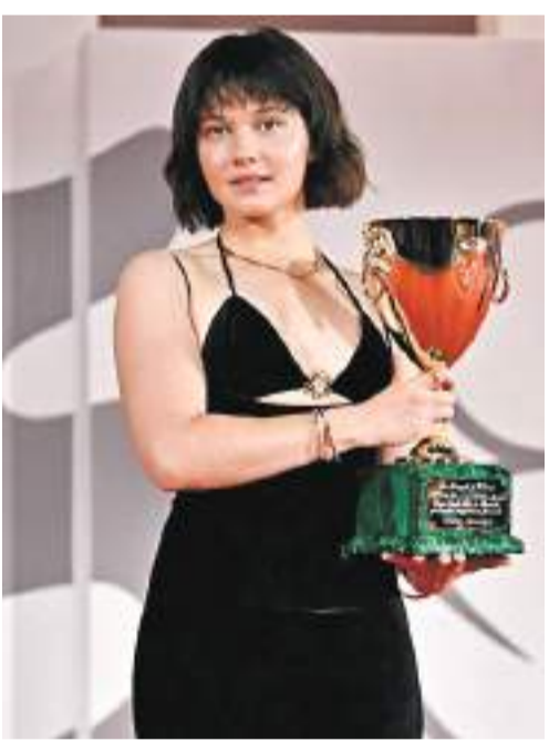
Cailee Spaeny 拿下最佳女演員獎。