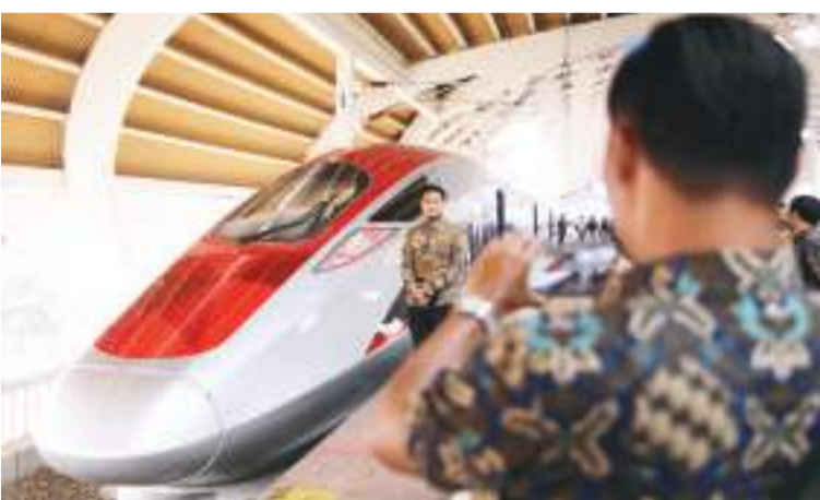
9月8日，在雅加达的哈利姆站，印尼建设者在列车前留影。