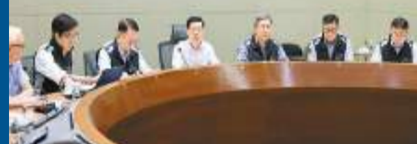
特首李家超昨午召開會議，聽取政府官員匯報各部門工作和市面復修情況，強調要把市民日常生活的不便減至最少。

李家超昨日召開會議，聽取陳國基等官員匯報工作和市面復修情況以及工作日安排部署，提醒各部門要保持最高狀態投入善後工作。其後，他在社交媒體表示，有道路和山泥傾瀉的工程因複雜性和廣泛性須繼續處理，加上持續下雨，部分地區再出現內澇，各部門必須爭分奪秒，讓市面恢復正常運作，把市民日常生活的不便減至最少。 李家超感謝團隊和公務員同事，以及各服務單位，全心一致，通力合作，在過去數天不晝夜工作，迅速修復路面及社區設施，肯定他們的付出。