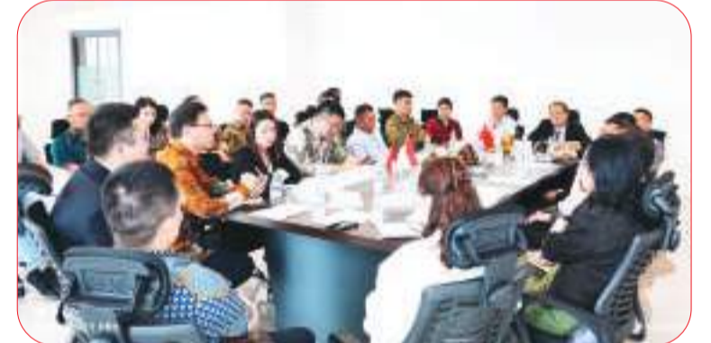
多位皖籍企业家分享经验