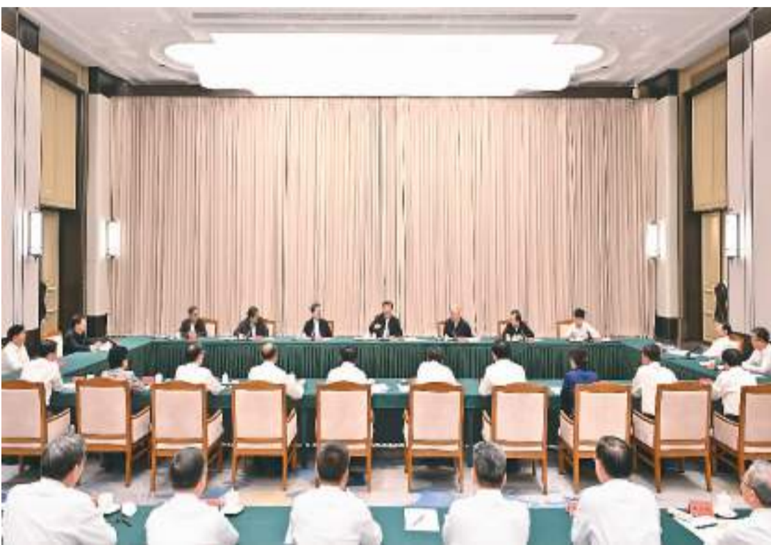
9月7日下午,中共中央总书记、国家主席、中央军委主席习近平在黑龙江省哈尔滨市主持召开新时代推动东北全面振兴座谈会并发表重要讲话。

本报哈尔滨9月9日电 中共中央总书记、国家主席、中央军委主席习近平7日下午在黑龙江省哈尔滨市主持召开新时代推动东北全面振兴座谈会并发表重要讲话。他强调,新时代新征程推动东北全面振兴,要贯彻落实党的二十大精神关于推动东北全面振兴实现新突破的部署,完整准确全面贯彻新发展理念,牢牢把握东北在维护国家“五大安全”中的重要使命,牢牢把握高质量发展这个首要任务和构建新发展格局这个战略任务,统筹发展和安全,坚持