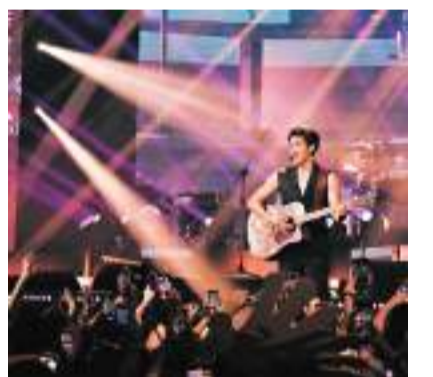
王力宏道出回到台北這個音樂家鄉的感受。

聽的歌，他特別改編加了一段「祈禱文」來自我鼓勵，也鼓勵大家，將恐懼變成力量與希望。