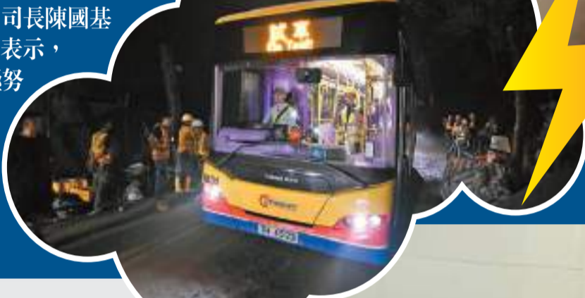
昨早6時許，往來石澳的公共運輸服務已恢復。