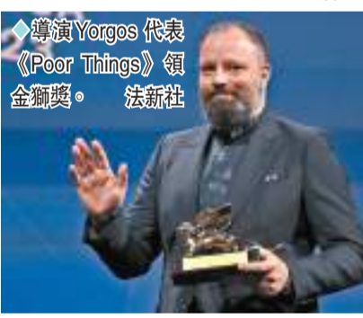
導演 Yorgos 代表《Poor Things》領金獅獎。