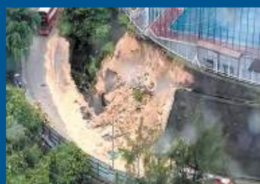
紅磡佛光街足球場附近發生山泥傾瀉，泥土佔據附近一段行車線。網上圖片