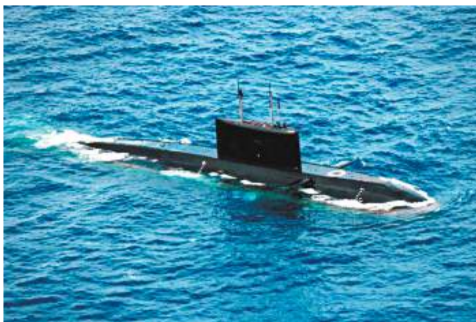
◆南部戰區海軍編隊艦艇編轉多個海區，擇機圍繞對潛作戰、輕武器射擊、艦載直升機起降等課目展開專攻精練。