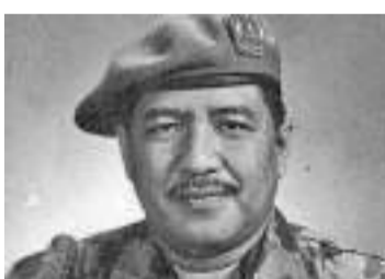
哈托诺退役海军中将

【本报讯】哈托诺(Hartono)退役海军中将是一位高度忠诚于苏加诺总统的人，他的一生对印尼的独立斗争事业扮演了重要的角色，他担任了很多的军事重要职务。