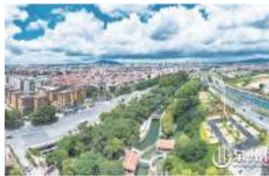
泉州水務集團為市北高幹渠功能調整輸水工程項目建設實施提供優質服務和要素保障,助力城市高質量發展。