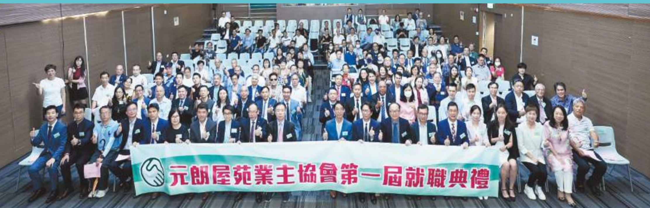
元朗各大社團領袖、政府部門首長、管理公司及業主組織代表出席，給予協會莫大的鼓舞。