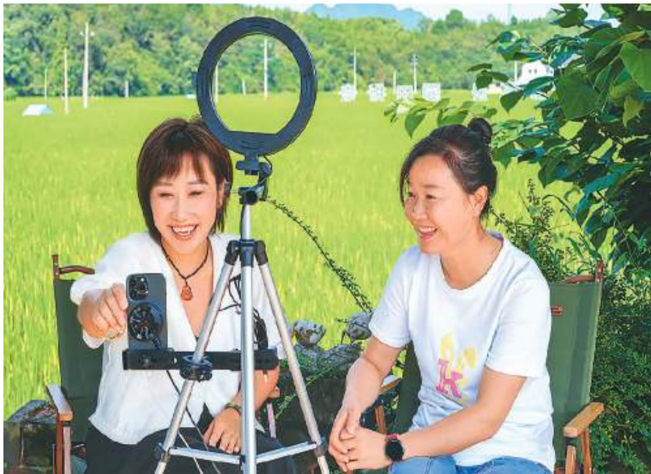
在浙江省杭州市临安区太阳镇太阳米基地，主播正直播介绍当地美景，并推荐民宿、餐厅等旅游相关产品。

如今，旅游预订、休闲娱乐、家电维修、家政服务、健康管理、汽车保养等领域加快线上、线下融合发展，越来越多的消费者习惯了线上预订购买、线下享受服务的方式。“互联网+”激发服务业新动能，深度连接商家与消费者，各类在线服务逐渐融入人们日常生活，成为消费热点。例如，想在家健身，可以购买“云健身”服务，请健身教练线上授课、指导等。