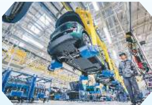
长江经济带生产制造的出口“金名片”。工人在加紧生产。

本,自主创新电池生产成为中国汽车的另一大竞争优势。比亚迪尤其受益于此,该公司积极创新生产新电池,据汽车研究中心估计,2023年比亚迪将在全球生产250万辆纯电动汽车和插电式混合动力车,从而实现规模经济。业界人士预测,未来中国电动汽车将逐渐扩大欧洲市场份额。——据德国之声电台网站报道