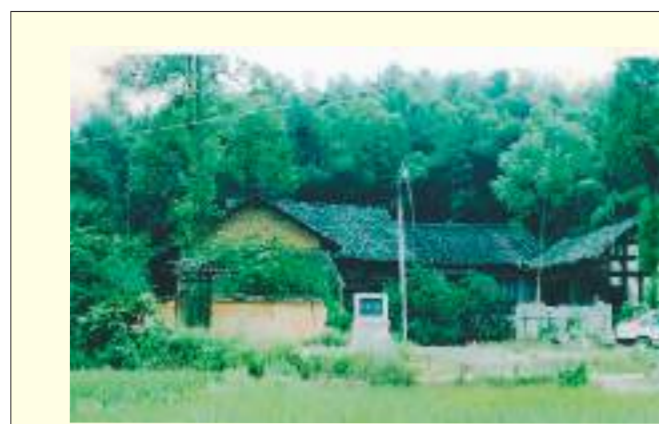
上图是2006年时的周立波故居。今日故居已成为周立波故居纪念馆（下图），馆藏有国家一级、二级文物在内的众多展品，展现了这位当代著名作家、翻译家和无产阶级革命战士的成长历程与文学成就。