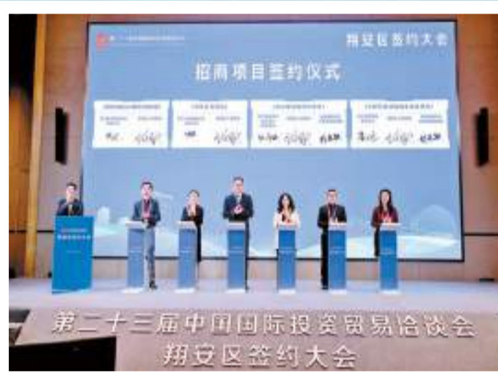
招商項目簽約儀式。

這就是發展勢頭強勁的翔安，在省、市的關心支持下，多個重大片區在這裏布局，多個重大戰略在這裏疊加，多個重大項目在這裏建設。在建區的短短20年間，翔安不僅實現經濟爆發式增長，產業也取得跨越式發展，日益提升的城市品質正不斷聚人氣、增活力，越來越多的企業家和投資者也選擇落戶這裏。 翔安區明白，簽約只是一個新起點。該區主要領導在現場明確表態：在後續的落地過程中，翔安區將以更高效率的服務，全力為廣大企業家提供最優質的環境，讓項目落下來、扎下根，讓大家放心投資、安心創業、順心發展，實現雙方共贏發展。 葉曉菲