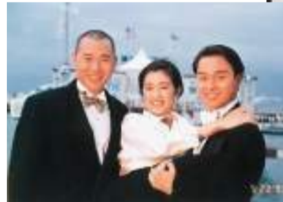
當年張國榮與章詒和、張曼玲合作愉快。

在張國榮一生的電影生涯中，除了成就外，他的敬業樂業態度亦為人津津樂道。翻查他過去拍戲的歷史，他從未和任何人在拍戲中引起紛爭，在徐克眼中，張國榮是個很懂得照顧別人的演員，他永遠不會擺架子及高高在上，有時候在片場，只要他看到其他合作的演員偶有情緒欠佳時，他會挺身跟導演說是否需要和那個演員聊聊，看怎樣去幫他。在《霸王別姬》數百名工作人員的劇組裏，就只有張國榮來自香港，他除了剛到北京首兩三天有點拘謹外，當他和工作人員稍為熟絡後，