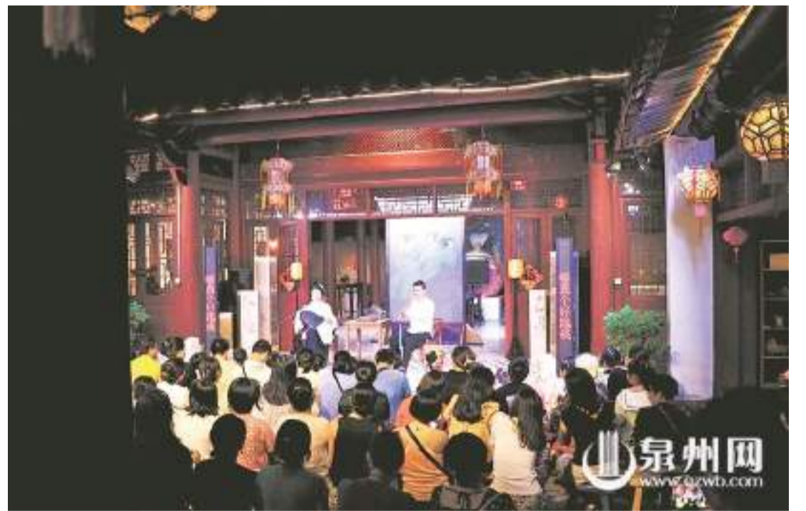
非遺體驗民宿專場

揚泉州非遺,讓來泉游客有更豐富的體驗,今年2月開始,鯉城區古城文旅住宿產業協會牽頭,由泉州印記閩南文化驛站組織,古城幾十家民宿抱團,試水非遺體驗民宿專場的常態化,至今已組織近20場體驗活動,受到了游客的熱烈歡迎。