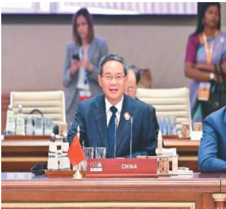
当地时间9月10日上午，国务院总理李强在印度新德里出席二十国集团领导人第十八次峰会第三阶段会议并发言。

当地时间9月10日上午，国务院总理李强在印度新德里出席二十国集团领导人第十八次峰会第三阶段会议并发言。李强表示，本阶段会议的议题是“同一个未来”。纵观人类文明历史，无论顺境还是逆境，对美好未来的向往