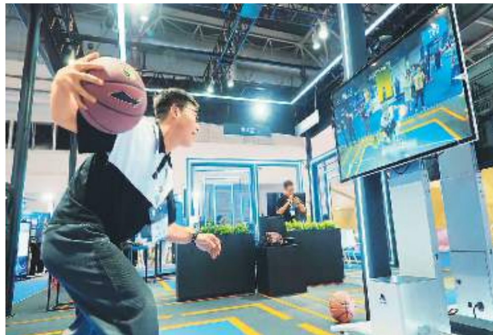
观众在北京中国国际展览中心（顺义馆）HICOOL 2023全球创业者峰会上体验“AI智慧体育课堂”。

如今，科技对教育发展的推动越发明显，新科技在教育领域的有效应用与深度融合，已经成为当下探索教育变革的重要路径。业内人士表示，未来将推动技术与教育更深层次的融合。一方面，要以智能技术助推教育空间数字化，构建数字化教育基础环境，打破空间和时间界限，用数字化教学资源助力教学、学习、考试、评价、管理等多个教育场景，改变传统教育场景形态；另一方面，要以智能技术助力教学过程数字化，实现以学生为中心的个性化教学。