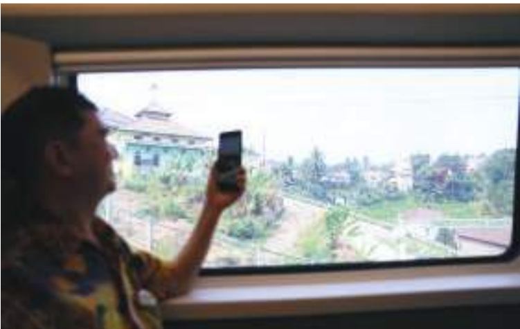
9月8日，在雅万高铁上，建设者往窗外拍照。

中新社雅加达9月9日电 中新社记者 李志全 7年了，蒂妮(Dinie)早就厌倦了雅加达到万隆之间没完没了的堵车。她“最糟糕”的一次经历，是头天下午5点下班，7点到车站，晚上12点坐上巴士，早上6点才回到万隆的家中。