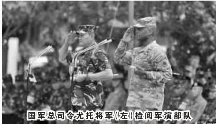
国军总司令尤托将军(左)检阅军演部队

【本报讯】9月10日，在徐图利祖(Situbondo)巴厘海军陆战队训练中心举行的2023超级神鹰盾牌联合军演高峰间隙，国军总司令尤托·玛戈诺海军上将表示，实施2023超级神鹰盾牌军演仍存在许多不足之处。其中一个缺点是，参与国没有相同的作战理论。我们需要完善的事情太多了，