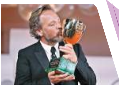
出爐影帝 Peter Sarsgaard 親吻獎盃。