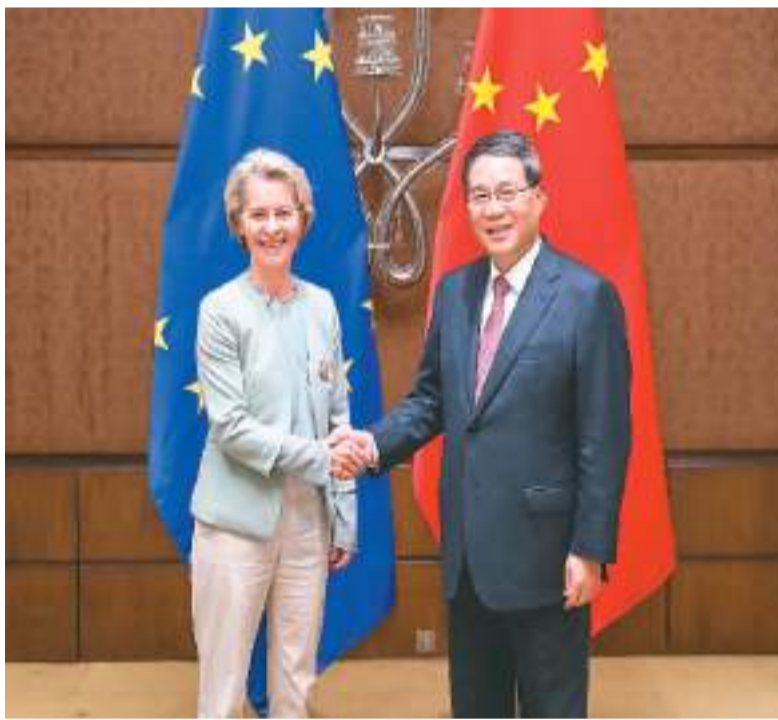
当地时间9月9日下午，国务院总理李强在新德里出席二十国集团领导人峰会期间会见欧盟委员会主席冯德莱恩。

本报新德里9月9日电（记者陈尚文）当地时间9月9日下午，国务院总理李强在新德里出席二十国集团领导人峰会期间会见欧盟委员会主席