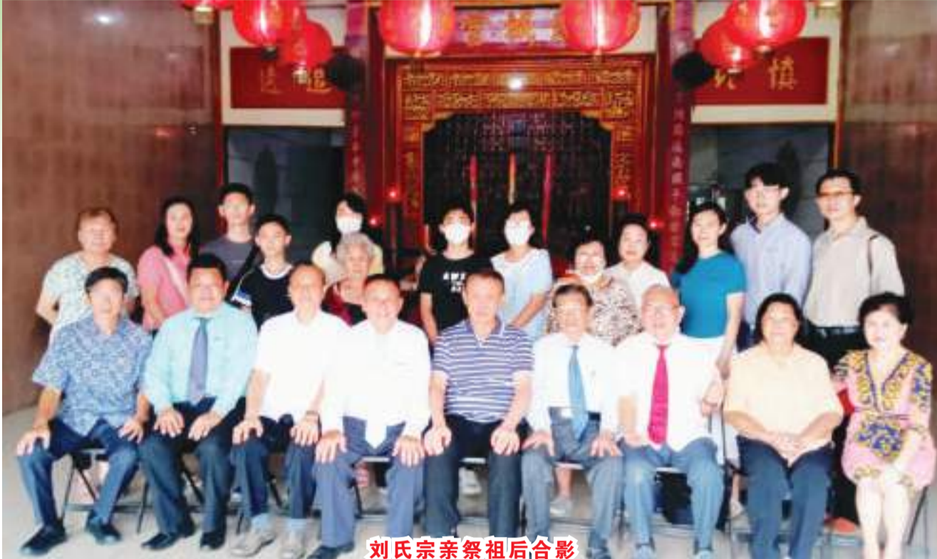
劉氏宗親祭祖後合影