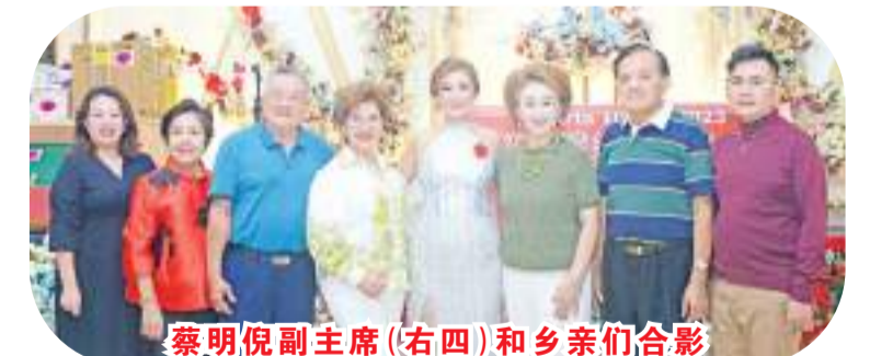
蔡明倪副主席(右四)和乡亲们合影