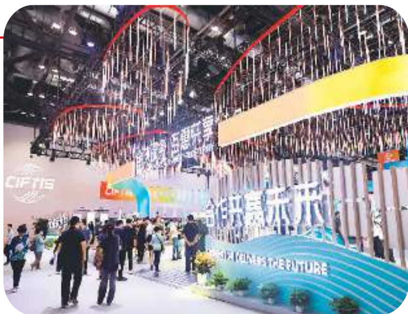
9月2日,观众在2023中国国际服务贸易交易会国家会议中心展区参观。

荟萃全球服贸产品,呈现中国市场活力。外媒纷纷聚焦本届服贸会,解读服贸会上释放的中国开放合作信号。