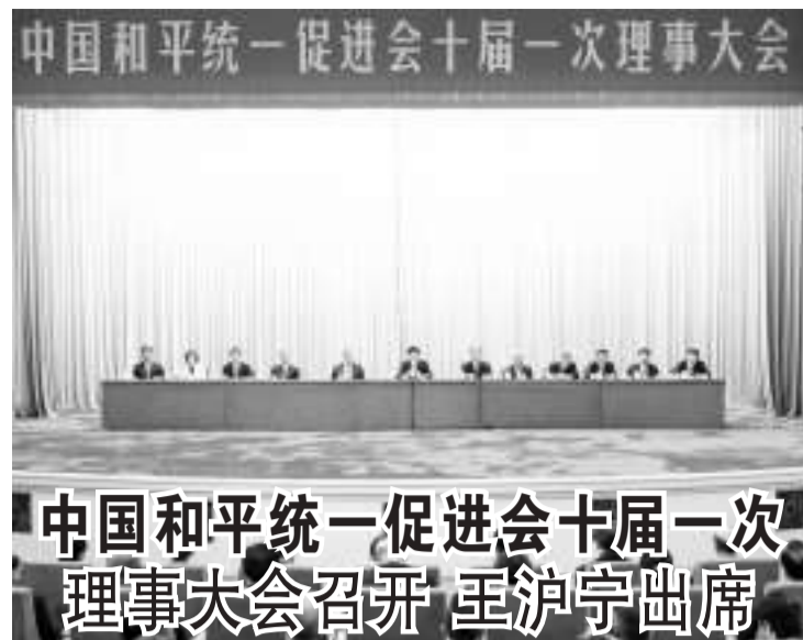
9月11日，中国和平统一促进会十届一次理事大会在北京召开。中共中央政治局常委、全国政协主席王沪宁出席会议并当选会长。

成的，反映了各成员国的共识。此次峰会再次确认，二十国集团是国际经济合作的主要论坛，不是解决地缘政治和安全问题的平台。我们始终认为乌克兰危机的最终解决关键在于摒弃冷战思维，重视和尊重各方的合理安全关切，通过对话谈判寻找政治解决方案。中方将继续致力于劝和促谈，同国际社会一道，推动乌克兰危机政治解决。