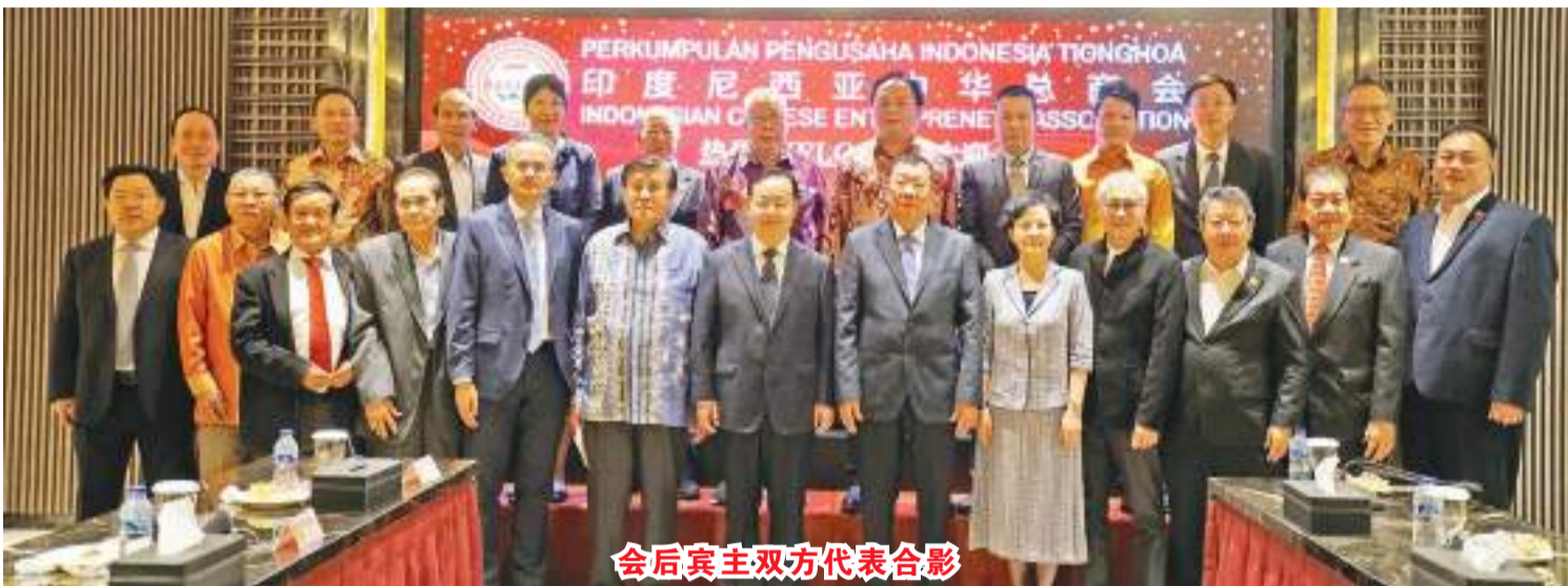
会后宾主双方代表合影

他指出,今天,我们总商会的组织建设已经不断壮大,总部设立在首都雅加达,同时在在爪哇省、西爪哇省、中爪哇省以及巴厘省及东努沙登加省,设有四个分会。我们也非常重视青年新生力量的培养和发展。2018年我会专门成立青年部,实行独立运营,定期组织专题研讨会、主题讲座等活动,及时为青年部理事提供专业政策解读及专业资讯解析,增进交流和讨论。