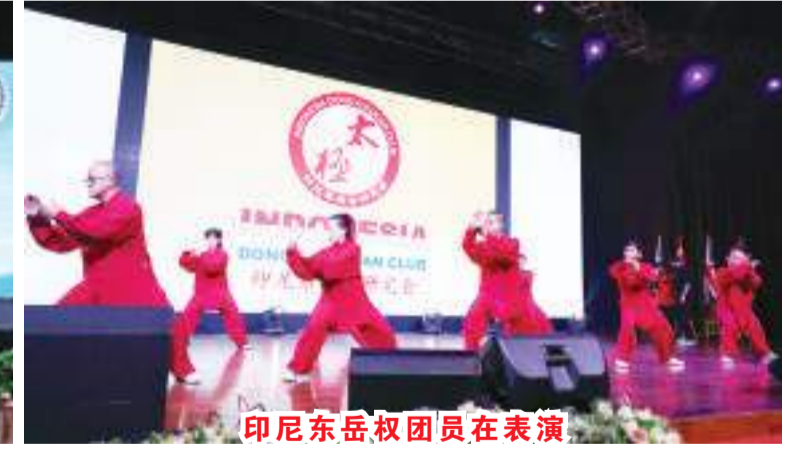
印尼東岳拳團員在表演