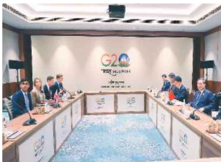
当地时间9月10日上午，国务院总理李强在新德里出席二十国集团领导人峰会期间会见英国首相苏纳克。