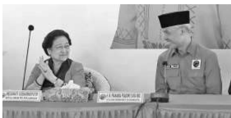
左起：梅加瓦蒂和甘贾尔

哈斯托指出，民意调查中出现的甘贾尔副总统人选的名单，除了已经流传的名单之外，还可能会出现一个新人物。虽然目前只出现五个人物。或许有些人物被