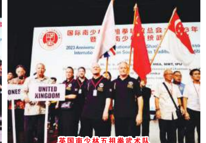
英國南少林五祖拳武術隊