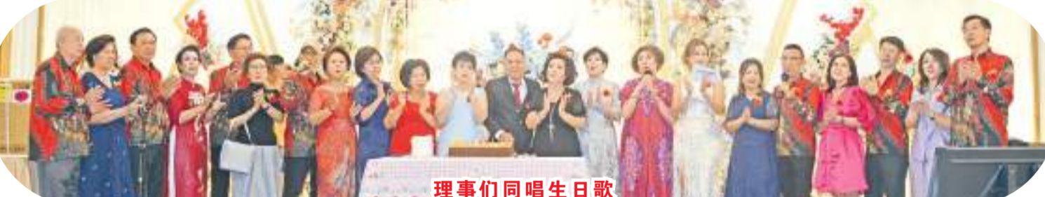
理事们同唱生日歌