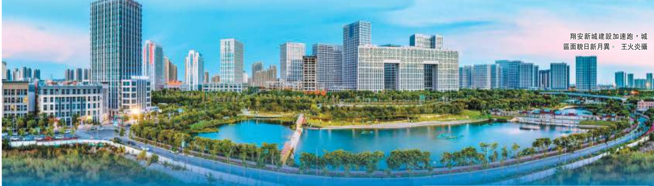
翔安新城建設加速跑，城區面貌日新月異。

九八逢白露，鷺島秋風至。在第二十三屆中國國際投資貿易洽談會上，廈門市翔安區捷報頻傳。本屆投洽會期間，翔安推動達成投資額436億元（人民幣，下同）。這些簽約項目涵蓋了多個行業，包括先進製造業、現代服務業、建築業、金融產業等，都是翔安區在經濟發展中重點發力的賽道。 在翔安這片煥發着勃勃生機的發展熱土上，不只有新項目正要簽約落地，還有不少重點項目正在加足馬力推進——在投洽會廈門市重大項目集中開竣工活動中，翔安轄區內共集中開工項目7個，總投資97.9億元；竣工項目6個，總投資329.1億元。