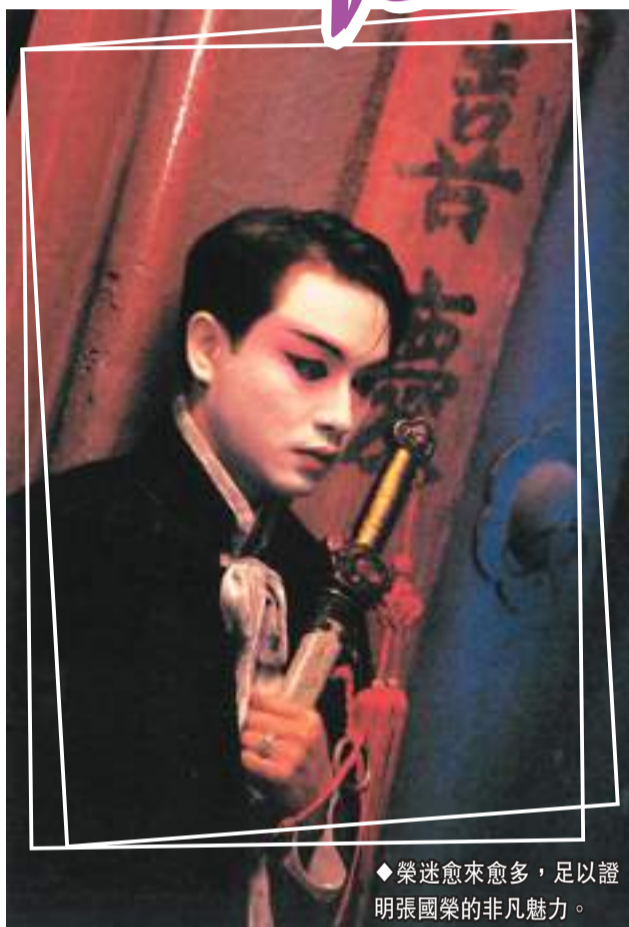
榮迷愈來愈多，足以證明張國榮的非凡魅力。

哥哥對人真誠，半不假，工作半年後已與劇組建立了深厚的感情，當戲拍完時，他的真性情更表露得淋漓盡致，在臨別秋波請大家吃熱炒，他比任何人都離愁緒緒和捨不得大家，他收下大家送給他的小禮物，古董小擺設和絲質內衣等等，他亦乾了不少酒，難過得眼紅紅，回房間後共吐了4個小時。後來他從康城影展回香港後，更把張曼玲老師等人請到香港一遊，一盡地主之誼。從這些小小的事情中就看到哥哥的情真意切，待人真摯，雖然他走了這麼多年，仍然被人永遠懷念，不無道理。他的歌曲及電影作品永留人間，所以後榮迷及新榮迷在過去二十年愈來愈多，這足以證明了哥哥的非凡魅力。