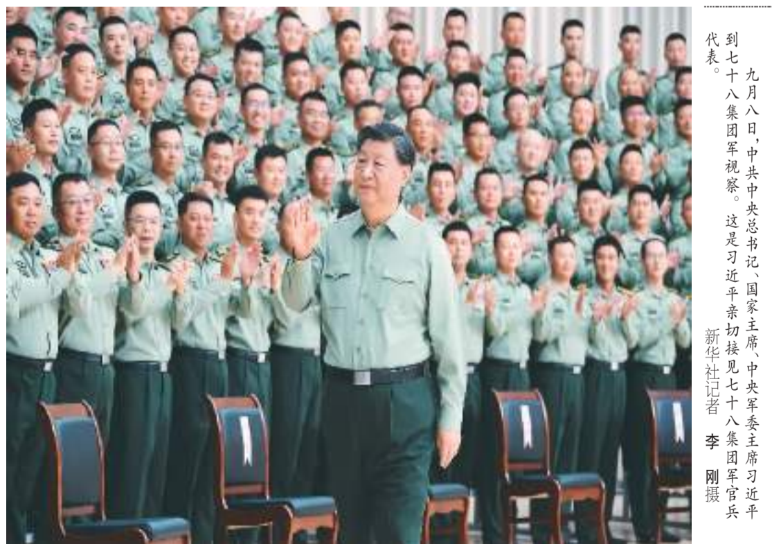
九月八日,中共中央总书记、国家主席、中央军委主席习近平到七十八集团军视察。这是习近平亲切接见七十八集团军官兵。