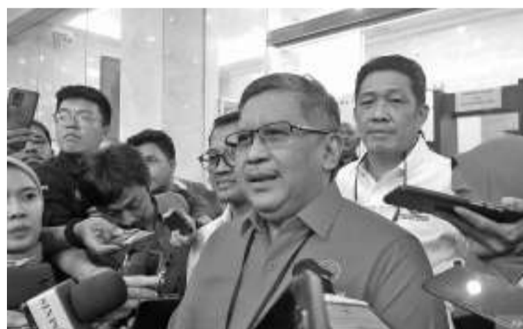
印尼斗争民主党秘书长哈斯托