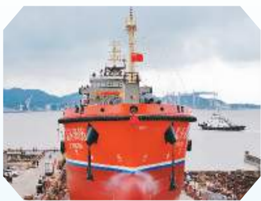
近日,国内最大吨位专业供油船“舟山船型”版首制修造有限公司顺利下水。

2023年,中国成为世界最大造船国,意味着中国拥有全球最为庞大的船队规模。作为世界第二大经济体和第一造船大国,中国进出口货物商船运输吨位日益增加。在政府的支持和鼓励下,中国造船企业产能和竞争力不断提升。2019年,中国船舶工业集团有限公司和中国船舶重工集团有限公司进行重组,成为世界上最大的造船企业。造船价格经济、质量提升是中国造船业新接单量在全球领先的重要原因。未来中国造船业将更注重提高质量,形成竞争优势。——据美国战略之页网站报道