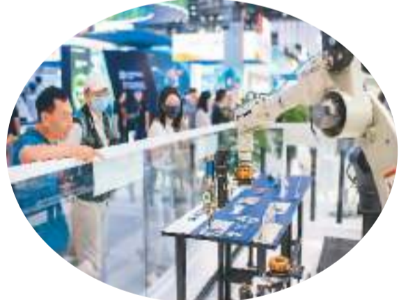
9月4日,在服贸会综合展区,参观者正在观看智能焊接机器人工作。