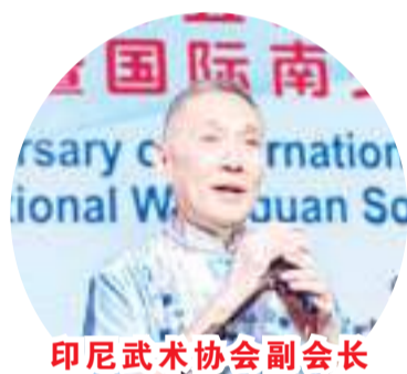
印尼武術協會副會長 Yusuf Hamka 致詞