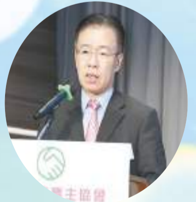
中聯辦副部長致辭祝賀協會成立，並給予莫大的冀盼，希望做好服務私人屋苑中產業戶的工作。