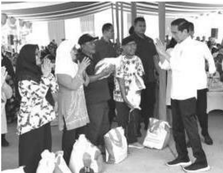
总统视察粮储局仓库大米库存

佐科维总统也已经同意了这项纲领,所需资金约达4000亿盾。 除此之外,佐科维总统也已通过粮储公共公司或粮储局(Bulog)分发了140万吨用于稳定价格和供应的大米(SPHP),以及第一阶段共64万吨的救济米。 阿里夫透露说,在共达140万户家庭中,每户家庭将获得1公斤鸡肉和10粒鸡蛋。另一方面,当局也希望通过这项社会援助纲领,能吸收养殖户过多的鸡肉和鸡蛋。