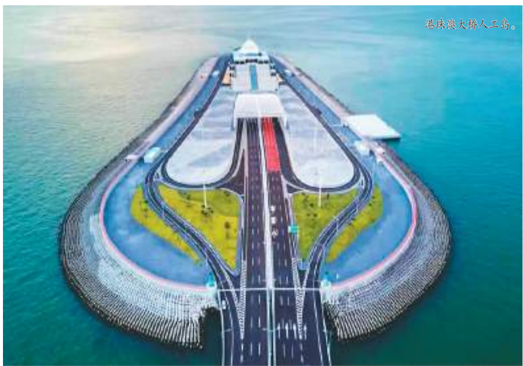
港珠澳大桥人工岛。