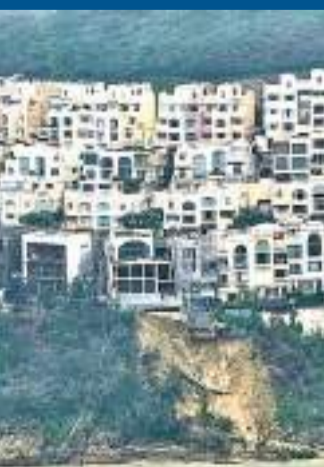
港島豪宅紅山半島發生山泥傾瀉，3間獨立屋受影響。

另外，世紀暴雨期間港島南區出現山泥傾瀉和路陷，其中石澳道須全線封閉搶修，該區數千居民猶如被困「孤島」，經路政署及土木工程拓展署連夜修葺連夜搶修並確認安全後，往來石澳的公共運輸服務昨早6時已恢復。城巴表示，自石澳道恢復單線行車後，昨早有限度恢復9號線服務，由於石澳道路況仍欠佳，單層巴士只能提供有限度服務，城巴呼籲市民於石澳道復常前避免前往石澳，以免影響石澳居民出入。