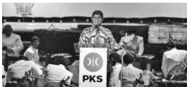
公福党仍支持阿尼斯参选

【本报讯】公正福利党中央理事会政治、法律和安部主席尤素夫(Almuzzamil Yusuf)表示，本党仍然支持阿尼斯作为总统候选人参选2024年选举。