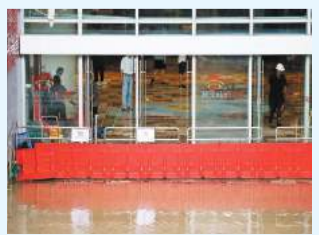
黃大仙中心北館正在搶修，昨日黃雨下一度再遇水浸。

另一方面，港鐵表示，黃大仙港鐵站D1出入口外因路面水位較高，已關閉並裝上擋水板；部分設備因水浸損壞而復修需時，B3出入口仍須關閉。預計排隊出入關及候車時間可能較長，站內升降機及扶手電梯亦繼續暫停使用，有需要乘客可使用樂富或鑽石山站乘搭觀塘線。