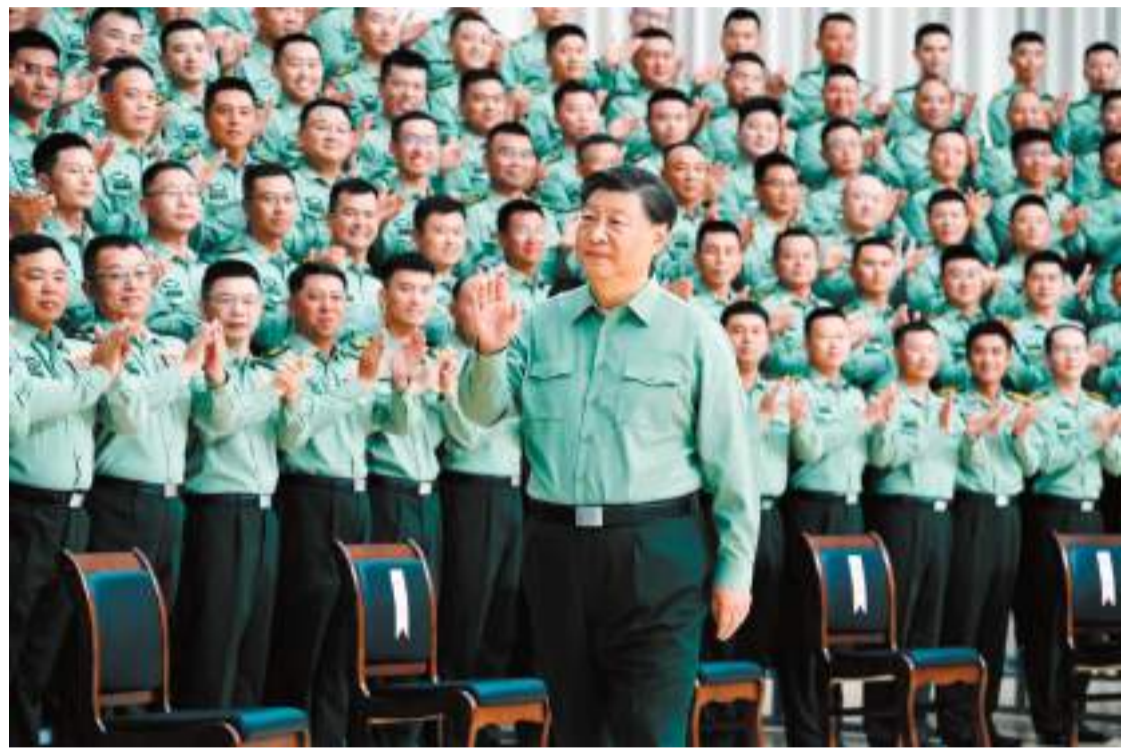
◆9月8日，中共中央總書記、國家主席、中央軍委主席習近平到78集團軍視察。這是習近平親切接見78集團軍官兵代表。