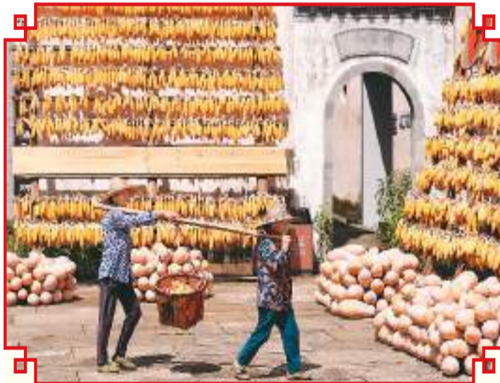
在安徽省黄山市徽州区千年古村落呈坎村,“呈坎晒秋”民俗为村民们利用晴好天气晾晒稻谷、玉米、南瓜、辣椒、笋干等农作物。