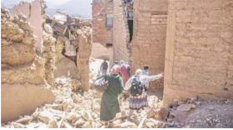
当地时间8日深夜摩洛哥发生强烈地震。图为震中附近村落的居民在震后逃离家园。