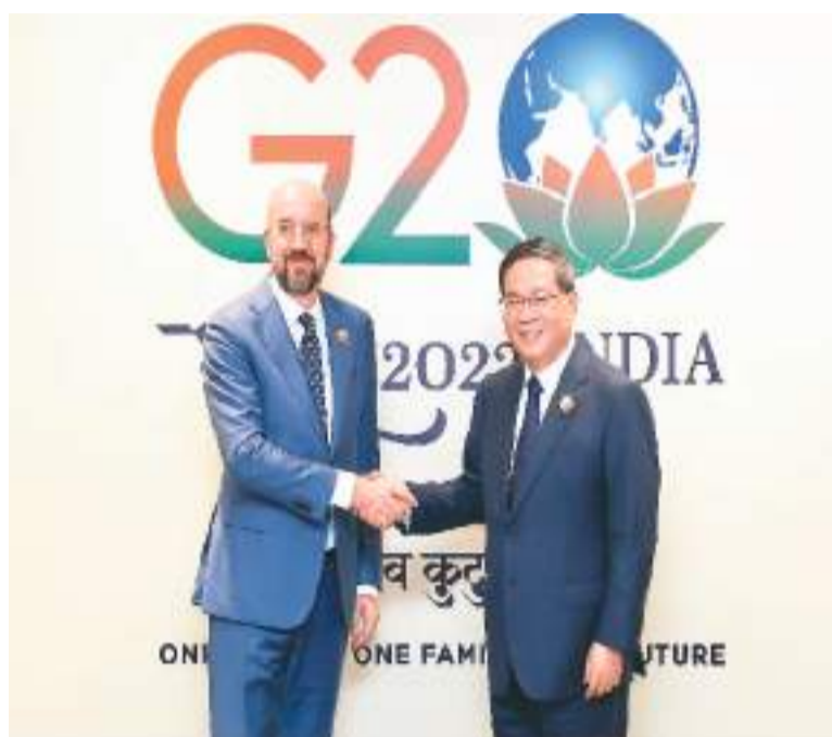
当地时间9月10日上午，国务院总理李强在新德里出席二十国集团领导人峰会期间会见欧洲理事会主席米歇尔。