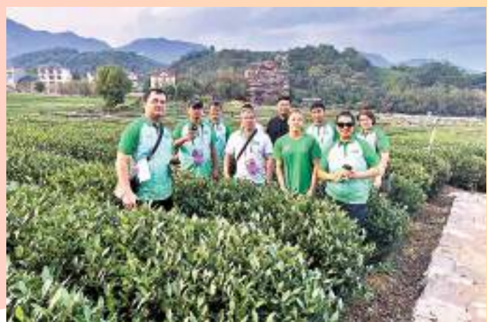
◆土庫曼斯坦代表團遊玩西湖龍井茶園。