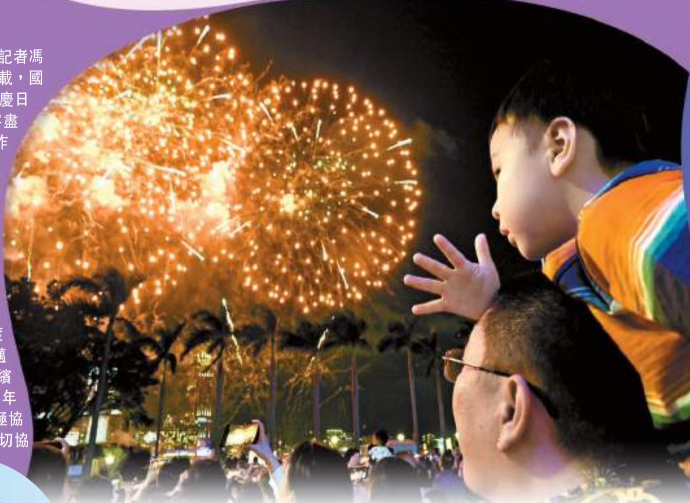
▲今年國慶煙花匯演有43萬人觀看，遠多於過去平均每年20多萬人的紀錄。

【香港商報訊】記者馮仁樂報導：睽違五載，國慶煙花匯演早前國慶日圓滿舉行，市民旅客盡興。行政長官李家超昨出席行政會議前表示，剛過去的國慶假期長周末，市民度過了喜慶熱鬧的節日。今年國慶煙花匯演有43萬人觀看，遠多於過去平均每年20多萬人的紀錄，而國慶煙花匯演事隔5年再次舉辦，亦象徵香港渡過難關，全面復常向前邁進。他亦透露「香港夜繽紛」活動將持續至明年初，強調政府部門會積極協調，為各項活動提供適切協助。