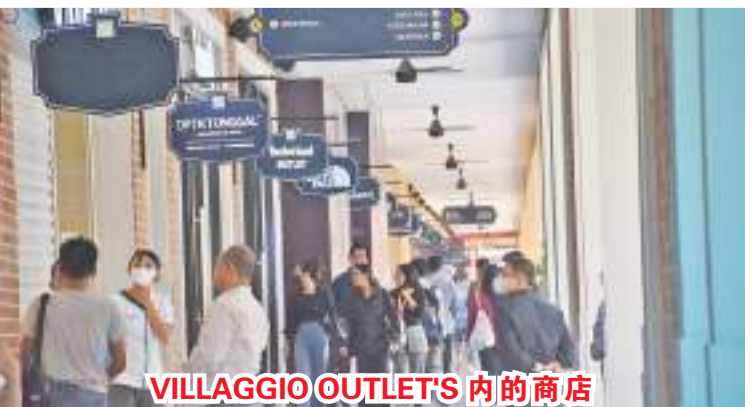
VILLAGGIO OUTLET'S 内的商店