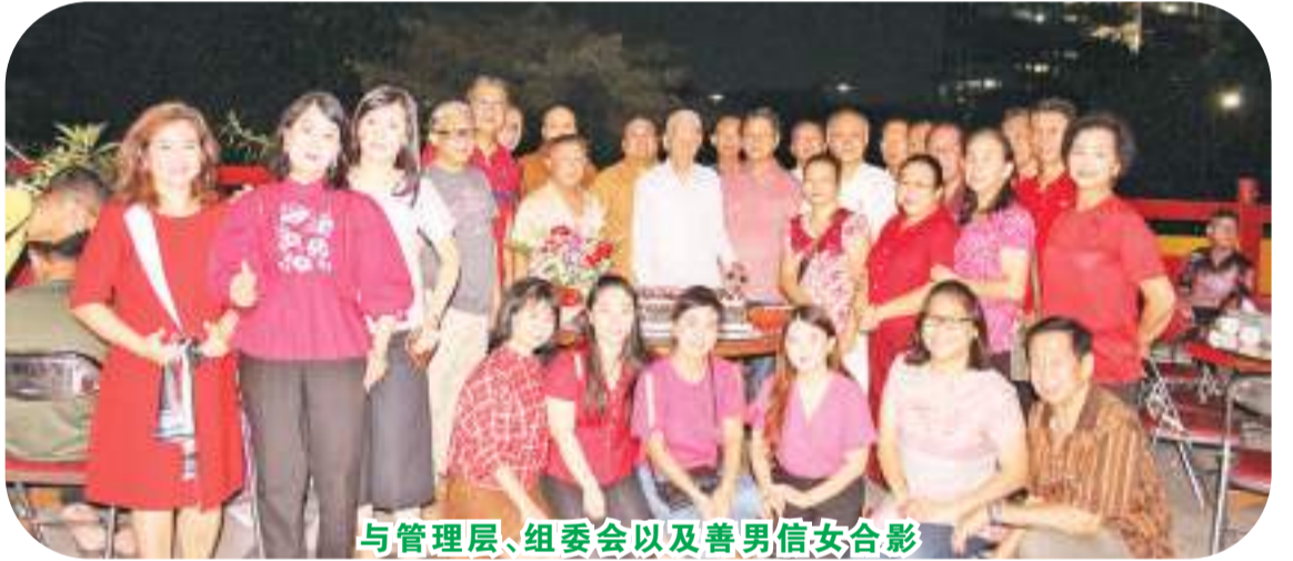
与管理层、组委会以及善男信女合影