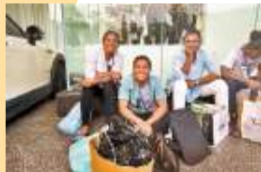
◆孟加拉國運動員前來買買買。