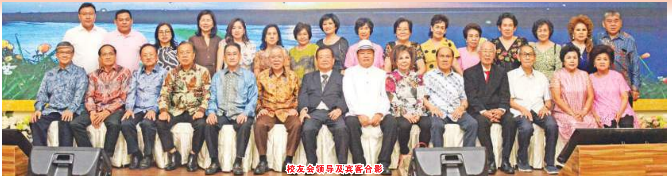
校友会领导及宾客合影

【本报讯】9月30日晚，旅椰西加邦夏中华中小学校友们欢庆中秋活动在雅加达“忘不了”大酒楼(Rest.EMPURAU)宴会厅热烈举行。逾300名旅椰邦夏中华中小学师生们齐聚一堂，共度佳