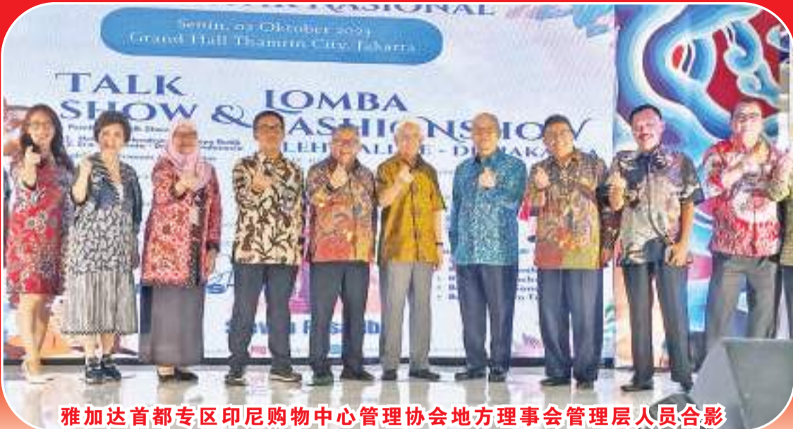
雅加达首都专区印尼购物中心管理协会地方理事会管理层人员合影