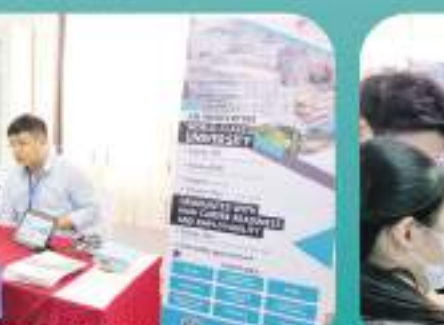
香港城市大学展位