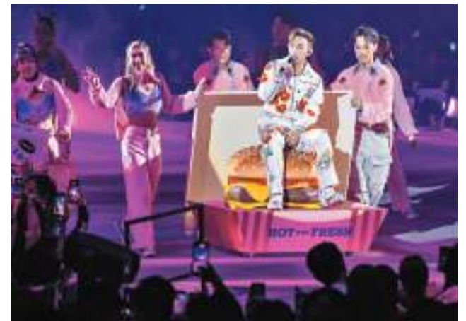
◆MC坐上漢堡包車被舞蹈員推着繞場一周。