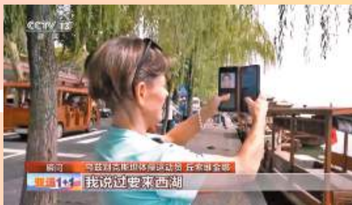
◆丘索維金娜終於來到了西湖。