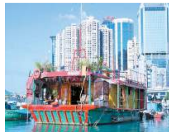
以往信眾需搭接駁小艇，到水上天后廟參拜。