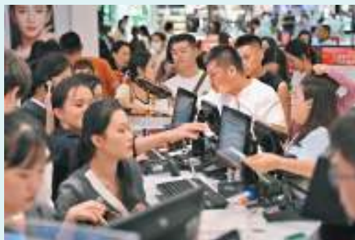
◆「雙節」前三天海南離島免稅購物金額4.26億元人民幣，同比增四成。

9月29日至10月3日舉行的第十五屆深圳國際車展，吸引了比亞迪、寶馬、奔馳等眾多知名車商。此次車展展出規模8萬平方米，眾多整車廠家攜旗下全系品牌車型參展，有約80個品牌和800多款車型同台亮相，其中新能源車成為主要亮點。其中4號館為比亞迪品牌專館，展示了方程豹豹5、宋L和海豹DM-i和漢等眾多車型。純電的漢最受消費者追捧，價格僅20萬元出頭，近年一直是比亞迪熱銷車型。