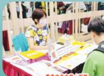
香港中文大学 | 深圳