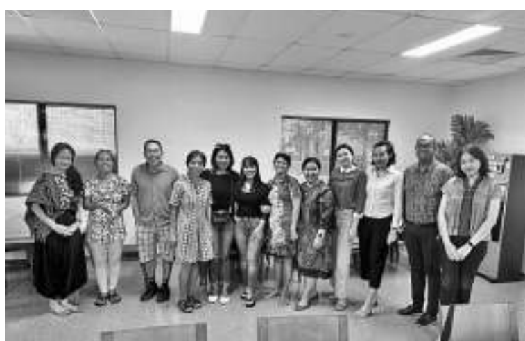
根据调查，60%我国旅居海外侨民想回国

法律信息中心主任戈德(Ketut Sumedana)表示，最高检察院在贸易部办公大楼和 Perusahaan Perdagangan Indonesia (PPI) 公司进行了搜查。从搜索结果来看，没收了一些与涉嫌腐败滥用职权案件有关的文件证据。调查小组从这两个地方发现并没收了一些与犯罪事件有关的文件和电子证据。(亮剑)