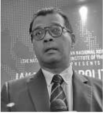
国防学院院长安迪

【本报讯】10月3日，国防学院院长安迪(Andy Widjanto)表示，2024年大选的最大风险将是政府联盟之间的政治摩擦。在国防学院评估了明年竞选的其他风险后，这种风险就为人所知。因此，政治摩擦的