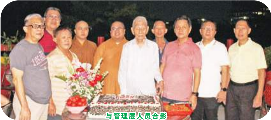
与管理层人员合影