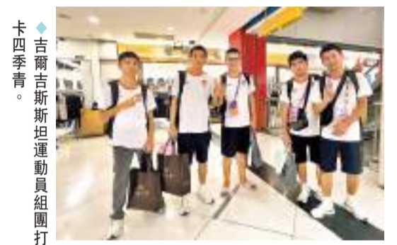
◆吉爾吉斯斯坦運動員組團打卡四季青。