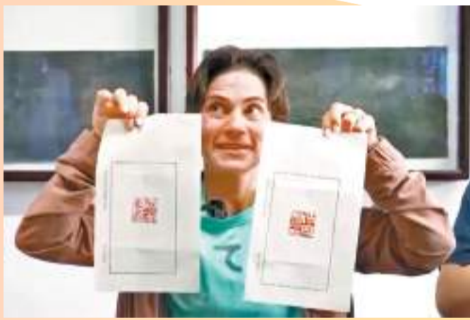
◆丘索維金娜在「西泠印社」蓋了兩枚印章。