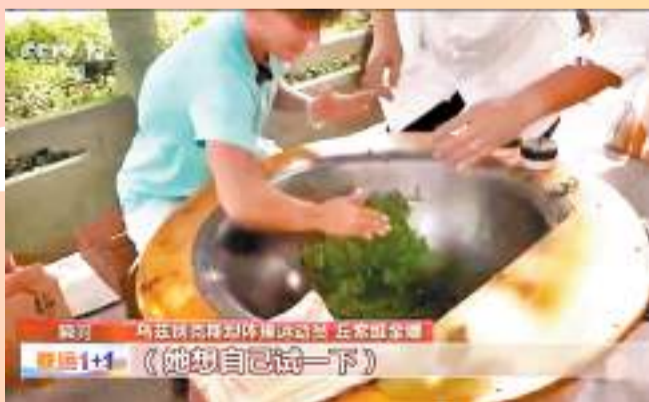
◆丘索維金娜學習炒茶。