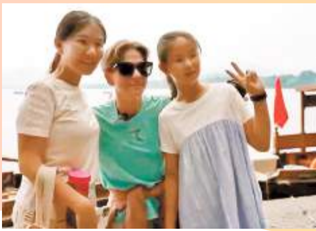
◆丘索維金娜大方與遊客合影。