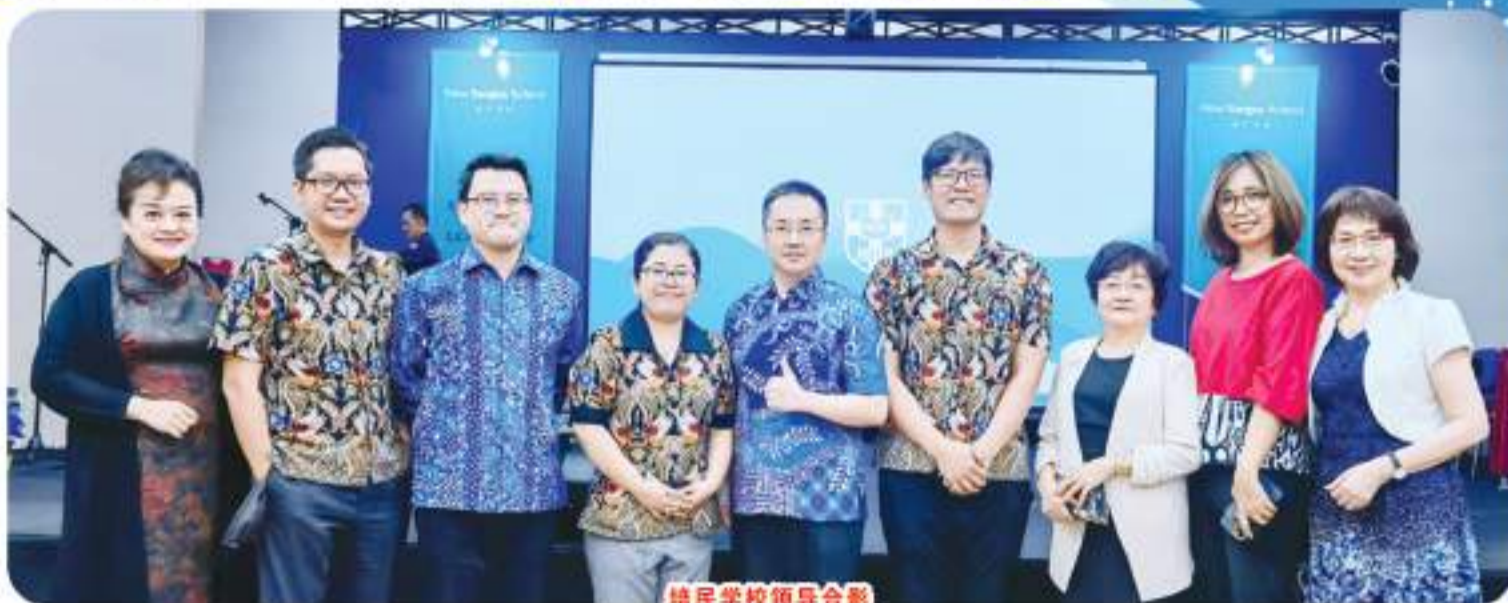
培民學校領導合影

2023年9月26日，“培民学校2023年大学教育展”在雅加达西区培民学校Kebon Jeruk校区中学大礼堂盛大开幕，本次教育展汇聚了来自中国、美国、英国、加拿大、澳大利亚、意大利、新西兰、新加坡、西班牙、瑞士、日本、马来西亚和印度尼西亚等13个国家的65所高校代表。其中世界排名前50的大学比比皆是，如清华大学、香港大学、多伦多大学、香港科技大学、墨尔本大学、悉尼大学、澳大利亚国立大学、莫纳什大学、香港中文大学、浙江大学、昆士兰大学、杜克大学、波士顿大学、香港城市大学等等。