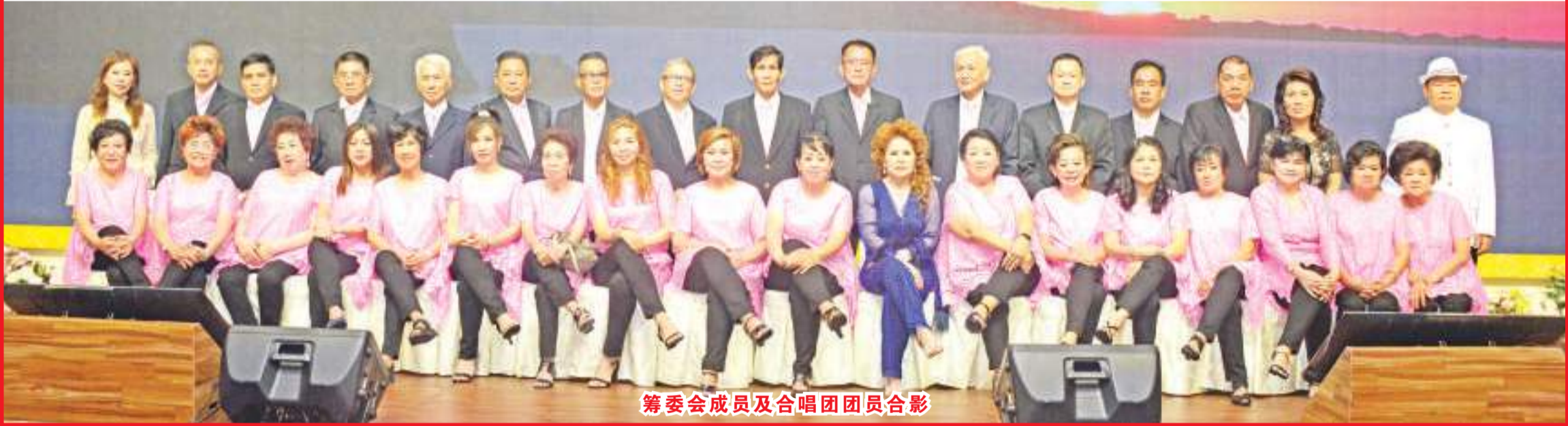
筹委会成员及合唱团团员合影