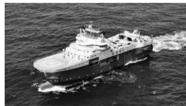
10月3日,中国自研海洋地震勘探装备“海经”首次实现超深水作业,图为“海洋石油720”物探船搭载“海经”系统进行超深水勘探作业。

中新社北京10月4日电 中国海油3日发布消息,“海洋石油720”深水物探船搭载中国自研海洋拖缆地震勘探采集装备“海经”系统,首次完成超深水海域地震勘探作业,发布了中国首张超深水三维地质勘探图,标志着中国深海油气勘探关键技术装备研制取得重大突破。 拖缆地震勘探技术是世界上探测海底地质结构最直接、最有效、最高效的方法。通过物探船搭载的成套拖缆装备“犁”过海面,以地震波信号实现对海底地层的“CT扫描”,从而看清海底的油气储层。 “海经”是中国自主研发制造的首套拖缆模式