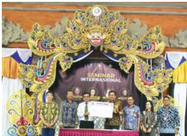
感谢了巴厘理工大学领导对中文教学的支持，期望中文教学中心在巴厘岛理工大学领导和老师的精心管

理与呵护下能办出特色、办出成效，希望通过中文教学可以更好地促进中印两国的交流，为中印两国搭建起文化和沟通的桥梁。