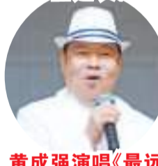
黄成强演唱《最远的你是我最近的爱》