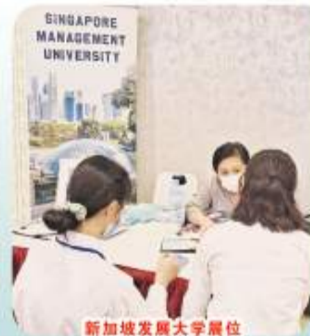
新加坡发展大学展位