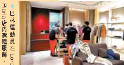
◆巴林運動員在Loro Piana店內選購服飾。