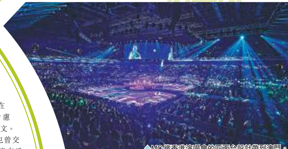
◆MC將香港演唱會的四面台設計帶到澳門。