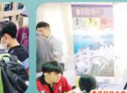
香港科技大学展位