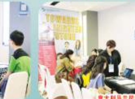
意大利马兰尼学院