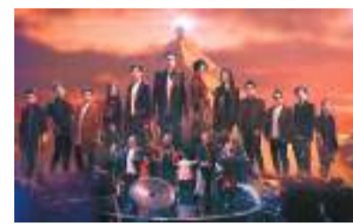
◆《中年好聲音》大受歡迎。

另外，10月1日國慶萬家歡騰，闖別香港5年、令人期待的國慶煙花匯演，重臨維多利亞港上空。當晚除維港兩岸有43萬人現場欣賞外，不少觀眾安坐家中，欣賞翡翠台現場直播《國慶煙花耀香江》，節目取得跨平台直播收視24.7點（159萬觀眾），成為日前收視冠軍！同天播出的《香港同胞慶祝中華人民共和國成立七十四周年文藝晚會》最高收視16.5點（106萬觀眾）。