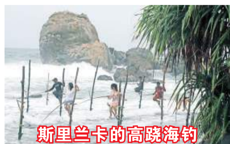
斯里兰卡的高跷海钓。10月3日，游客在斯里兰卡加勒体验高跷海钓。高跷海钓是具有斯里兰卡特色的一种海钓方式，渔人坐在一根矗立在海中的高高的木棍上，掌握好平衡和支撑的同时使用鱼竿钓鱼。

接触。我们非常重视加拿大外交官的安全，我们将继续私下接触，因为我们认为外交对话最好在私下进行”，乔利对记者说。特鲁多则表示，加拿大政府不希望争端升级。“我们非常认真地对待此事，我们将继续与印度政府进行负责任和建设性的接触”，特鲁多在另一个场合对记者说。印度外交部长苏杰生早些时候表示，印度驻加拿大的外交人员面临“暴力气氛”和“恐吓气氛”。在加拿大，锡克教分离主义组织的存在令新德里感到沮丧。9月18日，特鲁多发表紧急讲话，对印度政府提出“爆炸性指控”，称加拿大安全机构一直在紧密追查一项“可信的指控”——印度政府特工与加拿大公民尼贾尔被杀之间有着潜在联系。尼贾尔是一名锡克教领袖，2020年7月被印度政府列为恐怖分子，今年6月在加拿大不列颠哥伦比亚省萨里县一处锡克教文化中心外遭枪杀。