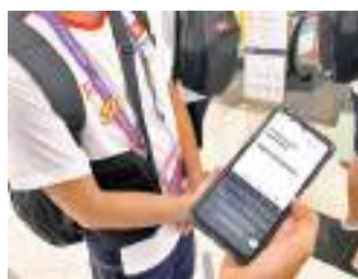
◆吉爾吉斯斯坦運動員正在用翻譯軟件詢問工作人員。