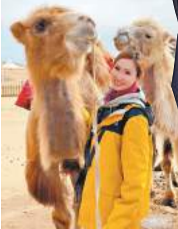
◆《無窮之路 II—無價之保》獲得「最佳紀錄片系列」。