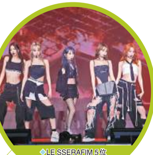
◆LE SSERAFIM 5位成員會港迷。

LE SSERAFIM 亦獻唱了多首熱門歌，包括《FEARLESS》、《ANTI-FRAGILE》、《UNFORGIVEN (Feat. Nile Rodgers)》、《Eve, Psyche and the Bluebeard's wife》等，唱到《Flash Forward》時成員們落台跟 FEARNOT 近距離接觸，更邊唱邊拿着自拍棍跟觀眾互動，將氣氛推至高潮。演唱會最後以《Fire in the belly》作結，成員採源更用廣東話說出「成為我哋嘅同伴啦！」一句對白，粉絲們隨即興奮尖叫，以最大歡呼聲作回應！