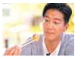
◆由黎諾誥主持的《滿足的味道》獲「最佳生活消閒節目」。