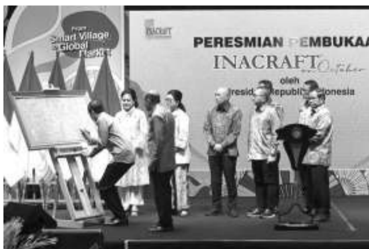
雅加达国际手工艺品交易会开幕

值得一提的是，雅加达国际手工艺品交易会于10月4日至8日在史纳延的雅加达会议中心举行，展览时间从上午10时至