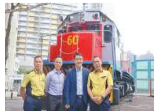
「喬沛德號」今日起在香港鐵路博物館展出。

適逢今年亦是舊大埔墟火車站，即香港鐵路博物館所在的原址建成110周年，鐵路博物館特呈獻「築載人物情——舊大埔墟火車站110周年」展覽，希望透過來自不同機構的珍貴歷史圖片，展示舊大埔墟火車站的歷史及發展。