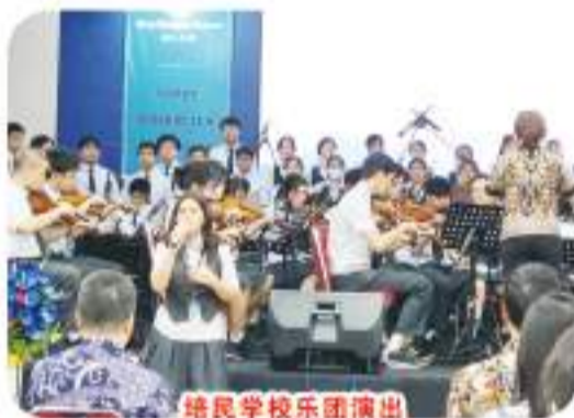
培民学校乐团演出