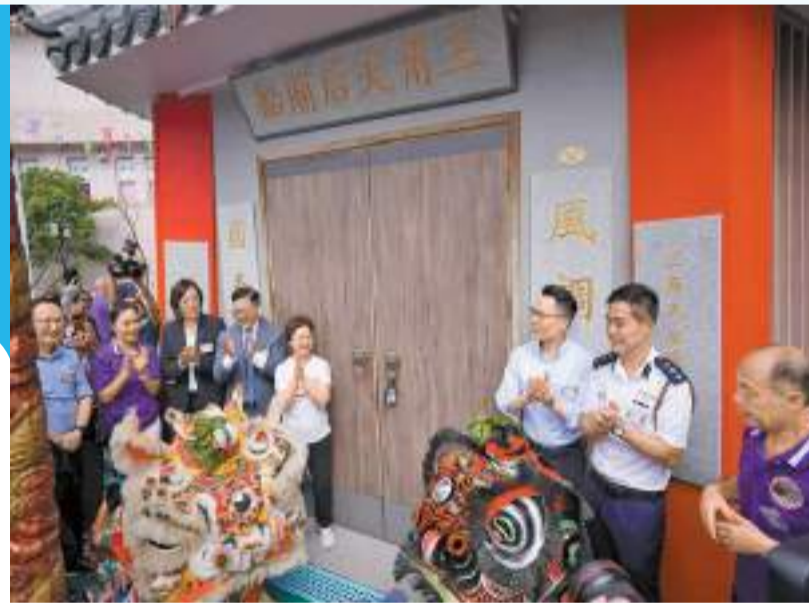
三角水上天后廟正式遷移上岸。

新落成的三角天后廟是仿照原來廟船的設計布局，充分表現自然和諧的氛圍，再配合中國傳統木構建築藝術，帶出社會祥和、團結友愛的象徵，展現香港作為中西文化匯聚及國際大都會的奮進不懈特色。三角水上天后廟船上岸工程，由爭取撥地、策劃至完成，歷時超過30年，建築費用超過1000萬元。