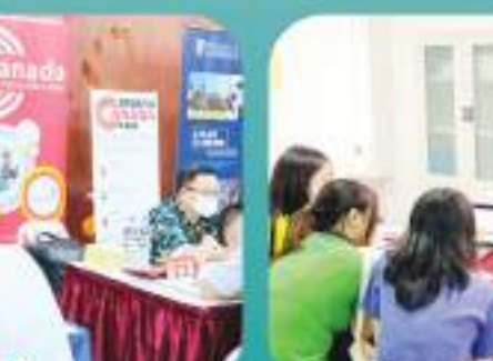
香港理工大学展位