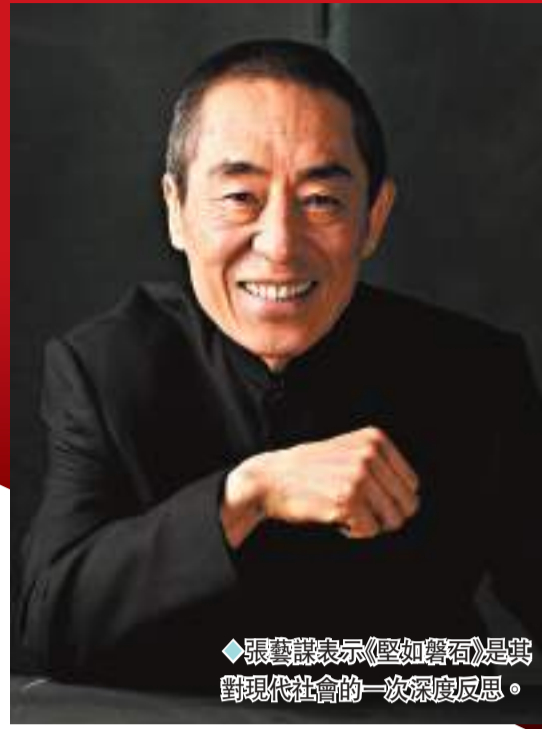
◆張藝謀表示《堅如磐石》是其對現代社會的一次深度反思。

香港文匯報訊(記者 任芳頌 北京報道)今年內地中秋國慶檔上映的影片類型豐富,涵蓋戰爭、動作、喜劇、懸疑、動畫等多種類型題材。據貓眼專業版數據顯示,截至10月1日18時許,2023年中秋國慶檔12部新片總票房(含預售)突破13億元(人民幣,下同)。其中,張藝謀執導的《堅如磐石》以4.1億元領跑,《前任4:英年早婚》以3.6億元、《志願軍:雄兵出擊》以2.3億元分別位於二三位。由香港導演邱禮濤執導,劉德華和張涵予時隔20年再度合作的《莫斯科行動》以1.5億票房排在第四位。