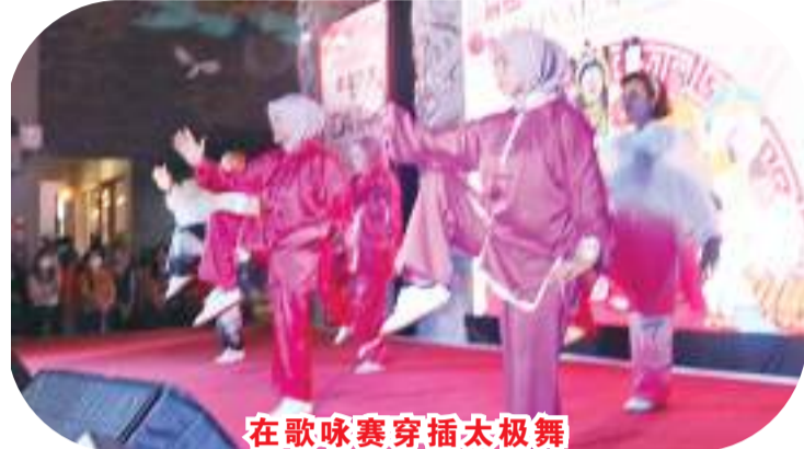
在歌咏赛穿插太极舞

欲了解更多信息，中秋节庆祝会由妇女事务和儿童权益保护部长 Bintang Puspayoga 宣布开幕，她对印尼华裔总会总部妇女部举办这项活动表示赞赏。她也表示，女性以各种方式处于保护文化的最前沿。