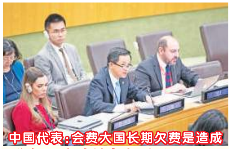
中国代表:会费大国长期欠费是造成联合国流动性危机的主要原因

美国众议院议长麦卡锡10月1日接受美国哥伦比亚广播公司(CBS)采访时强调,对于美国来说,自身边境问题比乌克兰问题更重要,在解决美国当前紧迫问题之前,乌克兰将不会获得大笔资金支持。