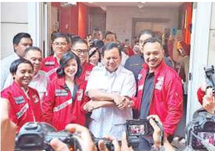
普拉波沃会见印尼团结党领导层

党回访大印尼行动党总部。在下午的聊天中,大印尼行动党邀请印尼团结党与KIR联盟。我们当然希望邀请所有爱国力量,全国所有力量共同努力。印尼团结党此前曾宣布在2024年总统大选中支持甘贾尔。甘贾尔是通过人民民意调查的结果,或印尼团结党进行的总统候选人物选出的。事实上,印尼团结党于2022年10月或印尼斗争民主党正式宣布推举甘贾尔之前,很早就宣布支持甘贾尔了。然而到目前为止,印尼团结党尚未被印尼斗争民主党接受为支持政党。之后,5月份,时任印尼团结党总主席吉凌表示,印尼团结党没有正式支持中爪哇省长,印尼团结党仍在等待佐科维总统的指示。(亮剑)