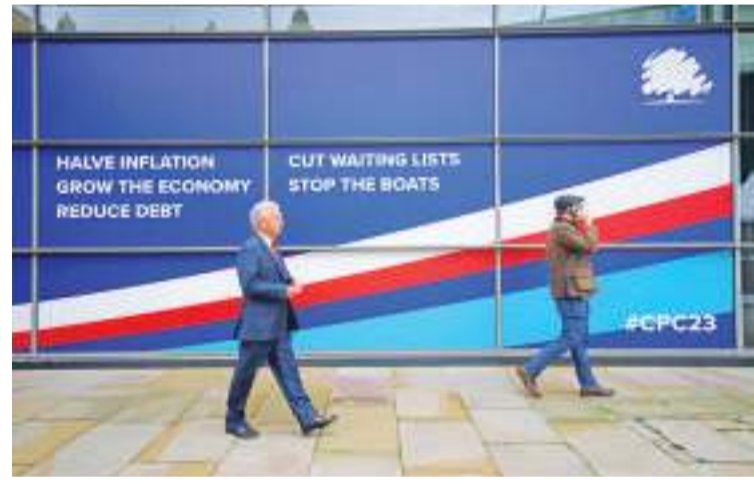
英国保守党年度大会在曼彻斯特举行

这些非法移民大部分都是来自得克萨斯州被转运而来的。“转运移民”日益成为美国党派和地方利益争夺的手段。2022年以来,得克萨斯和佛罗里达等共和党人执政的州政府多次将非法穿越美国南部边界的移民分批转运至民主党人主政的城市,如纽约、芝加哥等地。