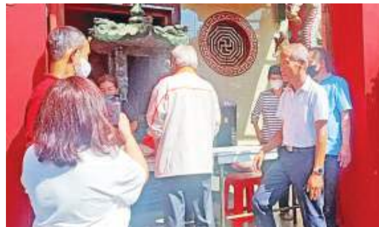
拿了领受券换包裹