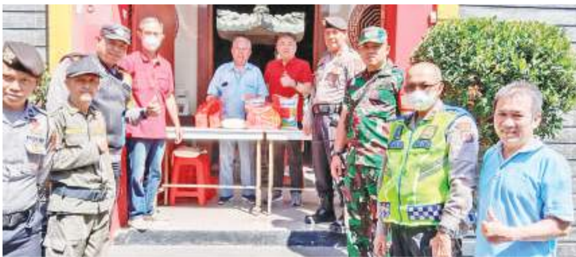
军警和保安在现场维持秩序