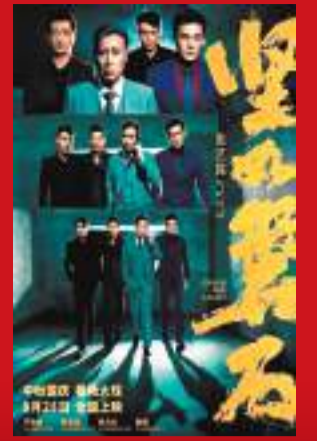
◆《堅如磐石》聚焦掃黑除惡鬥爭中的正義之戰。