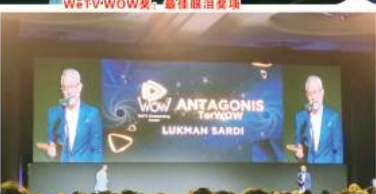
Lukman Sardi 获得WeTV WOW奖的最佳反应奖项