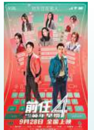
◆《前任4》繼續上演「揪心」愛情故事。