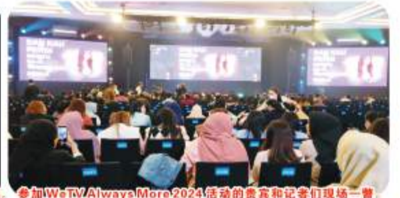
参加WeTV Always More 2024活动的贵宾和记者们现场一瞥