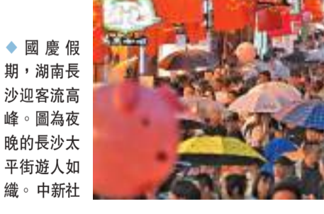
國慶假期,湖南長沙迎客流高峰。圖為夜晚的長沙太平街遊人如織。