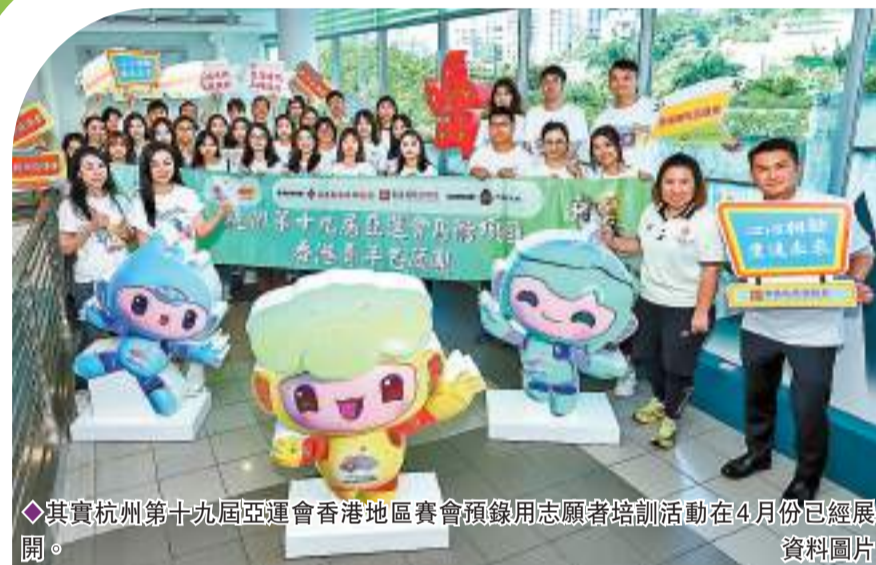
◆其實杭州第十九屆亞運會香港地區賽會預錄用志願者培訓活動在4月份已經展開。資料圖片