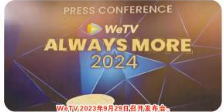
WeTV, 2023年9月29日, 召开发布会

Sinathya, Syifa Hadju, Haico Van Der Veken等印度尼西亚人气明星云集，此外中国演员邢菲和邢昭林也加入了明星阵容。 通过该发布会，印度尼西亚WeTV还宣布了一系列WeTV原创大剧片单，准备明年与大众见面。WeTV将推出各种类型的内容，无论是本地的喜剧、中国的甜宠剧、古装剧还是综艺节目，都将丰富大众的娱乐选择。