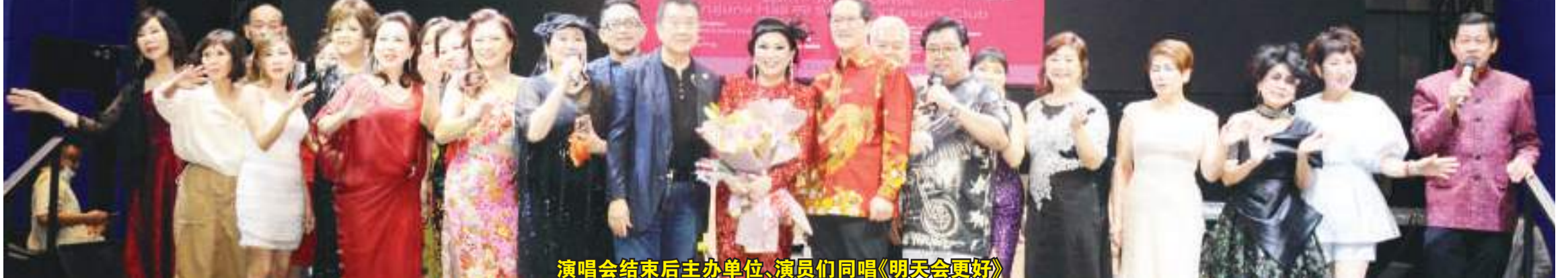
演唱会结束后主办单位、演员们同唱《明天会更好》