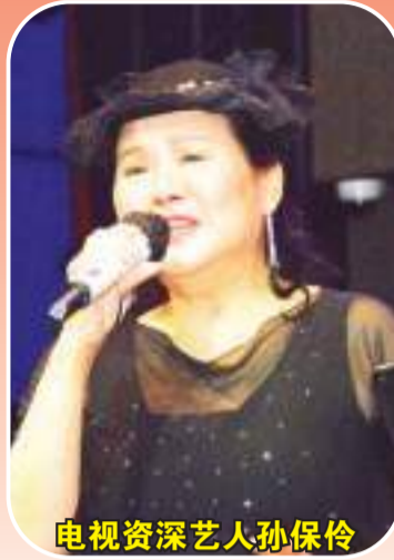
电视资深艺人孙保伶