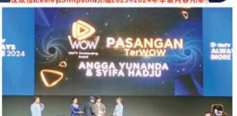
Angga Yunanda & Syifa Hadju 获得WeTV WOW奖的最佳情侣奖项