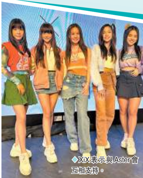
◆XiX表示與Aster會互相支持。

截至10月1日晚,今年以來全國電影票房已達460億元,接近2021年全年票房470億元。中國電影方面表示,2019年至2021年國慶假期內的票房體量均超40億元左右,假期後好口碑影片還有長尾效應,預計今年中秋國慶檔整體票房在40億元以上,仍有擴展空間。