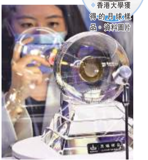
香港大學獲得的月球樣品。

嫦娥五號是中國首個無人月球採樣返回任務,是當時中國複雜度最高、技術跨度最大的航天系統工程,一舉突破月面採樣、月面起飛上升、月球軌道交會對接與樣品轉移、跳躍式再入返回等關鍵技術,經過環環相扣的飛行過程,帶回1731克月球樣品,成為世界單次採樣量最大的無人月球採樣任務。嫦娥五號任務是中國實現高水平科技自立自強的生動實踐,為後續的無人月球科研站、載人登月等奠定了基礎,是中國航天發展的又一個重要里程碑。