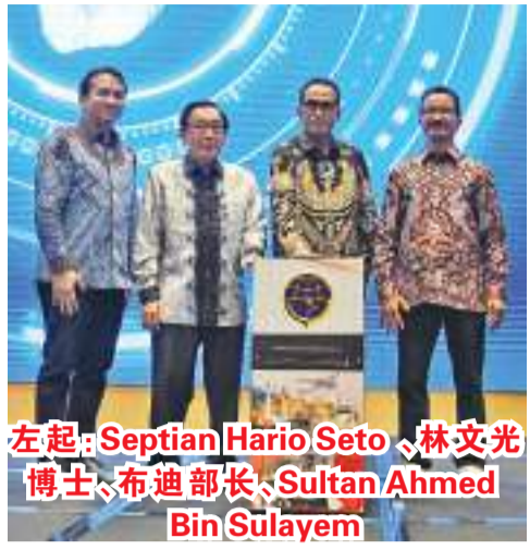
左起:Septian Hario Seto、林文光博士、布迪部长、Sultan Ahmed Bin Sulayem

10月2日雅加达,阿联酋迪拜环球港务集团与印尼金锋集团(DP World - Maspion)东爪哇省集装箱码头项目特许经营协议签署和项目启动仪式在国家交通部办公室顺利举行。特许经营协议由东爪哇省第二级航运与港口局办公室豪特曼(Hotman Siagian)主任