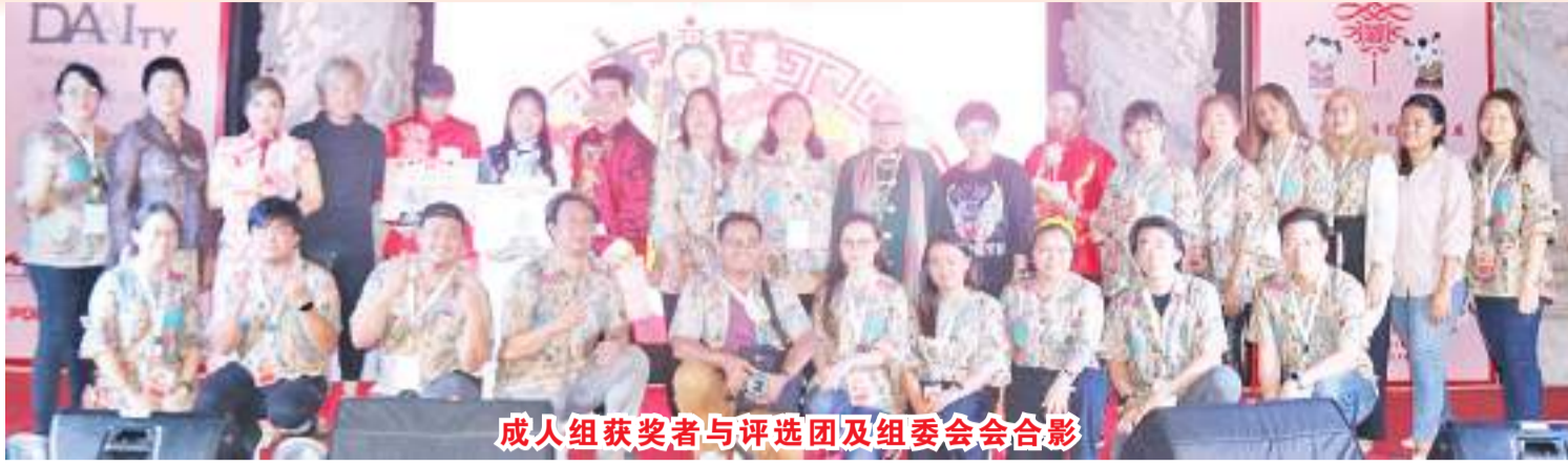
成人组获奖者与评选团及组委会合影

从活动第一天到闭幕，来支持的人们都流露出满腔热情。这就是为何印尼华裔总会总部妇女部继续举办一年一度的歌咏赛的原因。