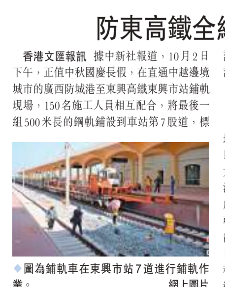
圖為鋪軌車在東興車站7道進行鋪軌作業。

香港文匯報訊 據中新社報道,10月2日下午,正值中秋國慶長假,在直通中越邊境城市的廣西防城港至東興高鐵東興車站鋪軌現場,150名施工人員相互配合,將最後一組500米長的鋼軌鋪設到車站第7股道,標誌著防東高鐵全線鋪軌完成,為今年年底全線計劃開通運營奠定基礎。背靠十萬大山 地形地貌複雜 防東高鐵沿邊沿海,背靠十萬大山,地形地貌複雜,共有8座隧道、32座橋樑,橋樑比達68%,長鋼軌運輸和鋪設風險高、難度大。自8月8日開始鋪軌以來,國鐵南寧局沿海鐵路工程建設指揮部、廣西沿防東高鐵完成鋪軌後,國鐵南寧局將繼續推進全線焊軌、鋼軌應力放散和軌道精調,並開展全線靜態驗收工作,為聯調聯試做好準備。截至目前,防東高鐵隧道、橋樑、路基、鋪軌工程已全面完成,全線預計今年12月底具備開通條件。