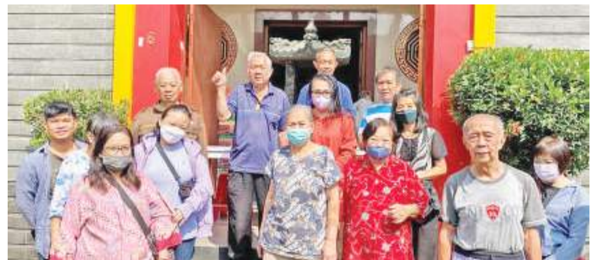
受惠者在德运堂前留影

【万隆讯】疫情似乎已经过去，可留下的负面影响还是让很多人们的生活拮据。因此很多社会机构，善长仁翁基于人道主义和怜悯心，还是不停地做社会福利慈善工作，让爱心波及各方弱势群体。