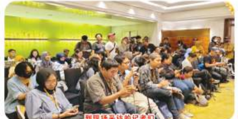
到现场采访的记者们