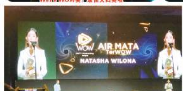
Natasha Wilona 获得WeTV WOW奖的最佳眼泪奖项