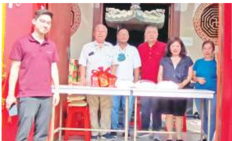
德运堂参与福利慈善的师兄师姐