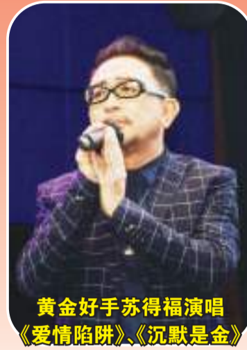
黄金好手苏得福演唱《爱情陷阱》、《沉默是金》