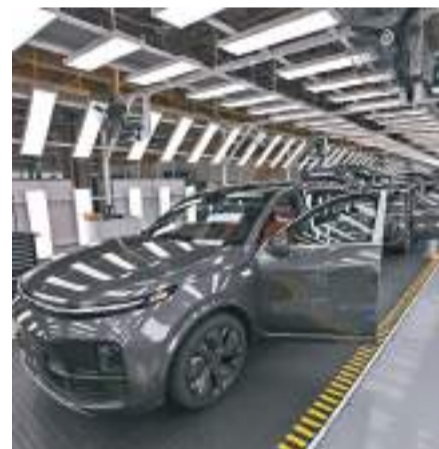
◆理想汽車第三季新車交付量飆升近三倍。 資料圖片

此外，公司向包括控股股東何小鵬收購行餘下74.82%股權至全資擁有，現金總代價9,896萬美元。鵬行自成立以來一直致力於具有人機交互功能的機器人研發，至今已積累246項知識產權，涵蓋運動控制、機械臂控制、機器人自主導航等。