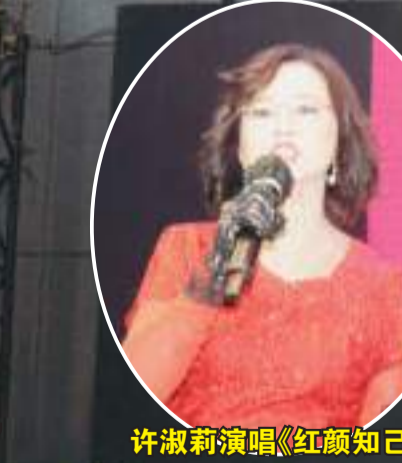
许淑莉演唱《红颜知己》