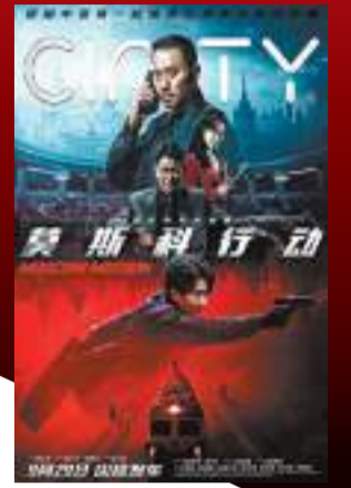
◆劉德華和張涵予時隔20年再度合作《莫斯科行動》。