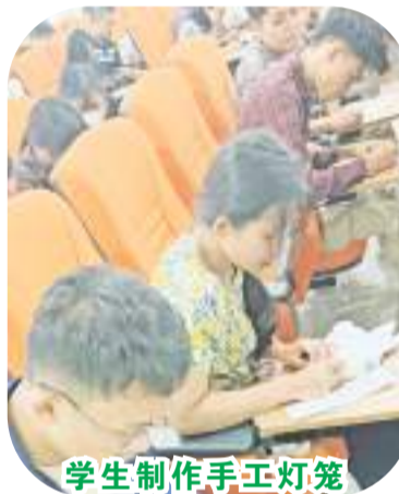
学生制作手工灯笼

动,也让印尼学生共赏中国古风佳节浪漫,共享中国传统文化之美。世界多元,文明互鉴。乌达雅纳大学旅游孔子学院作为巴厘岛地区传播中国文化、加强中印尼文化交流的重要窗口,未来会继续不忘初心,踏歌而行。(鲁红艳报道)