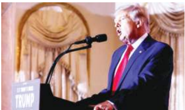
资料图:美国前总统特朗普。

中新网10月6日电 据美国福克斯新闻网5日报道,美国前总统特朗普透露,他正考虑短期出任众议院议长一职,但他的长期目标仍是竞选美国总统。