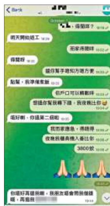
騙徒在蝌蚪的Telegram賬戶內冒充他，向其朋友借錢，幸朋友有懷疑而拒絕。

對自己的Telegram賬戶被入侵，他表示不知原因，「只是早前收到Telegram訊息話我好耐用，叫我更新賬戶，但不知是不是騙徒騙我。」與WhatsApp不同，Telegram未有屏蔽行騙訊息，他當晚看到賬戶內騙徒向朋友借錢的對話，才知被入侵，立即致電朋友說明情況，亦在WhatsApp通知所有親友有關事件，着他們小心受騙。