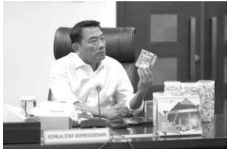
穆尔多科推荐木薯粉成为替代粮食材料 图示：总统府办公厅主任穆尔多科(Moeldoko)退休将军于10月6日在雅加达总统府Bina Graha办事处，正在观摩从印尼木薯社会民众组织(MASSI)赠送的各种薯粉食品。他就此事推荐木薯粉应成为替代的粮食。

值得注意的是，印尼自由港公司目前拥有两个采矿地点。Ertsberg被称为铜矿产地，而Grasberg则是金矿产地。在1988年发现Grasberg矿床之前，Ertsberg已于在1936年首次发现，并以其特征命名为“Ertsberg”，即铜山。