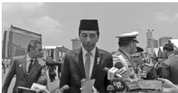
佐科维总统表示退休后无意担任斗争民主党总主席