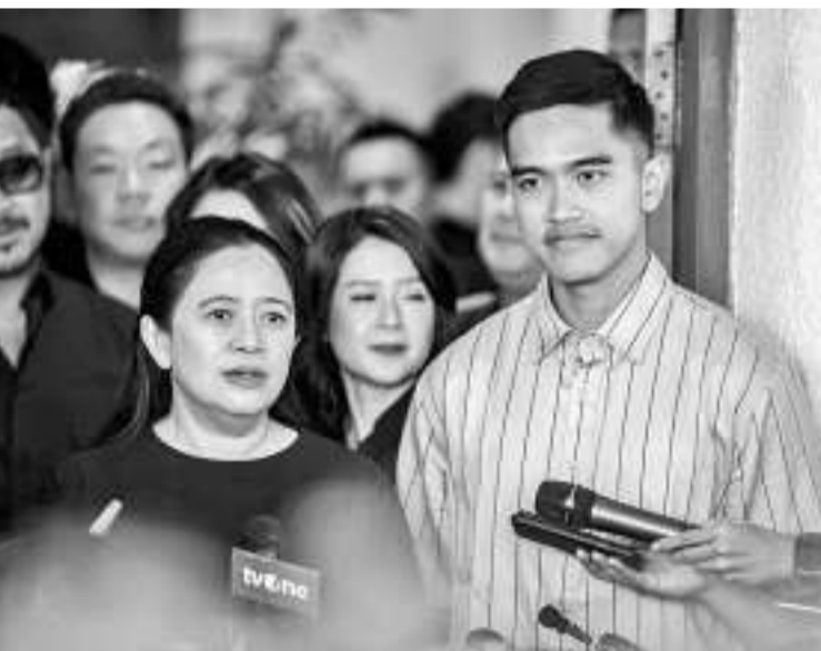
左起：普安与凯桑会谈

普安表示，在会晤中，印尼斗争民主党正希望刚由凯桑领导的印尼团结党与印尼斗争民主党都持开放态度。在这次会晤中，我们试图能够相互敞开心扉，讲述或传达凯桑在印尼团