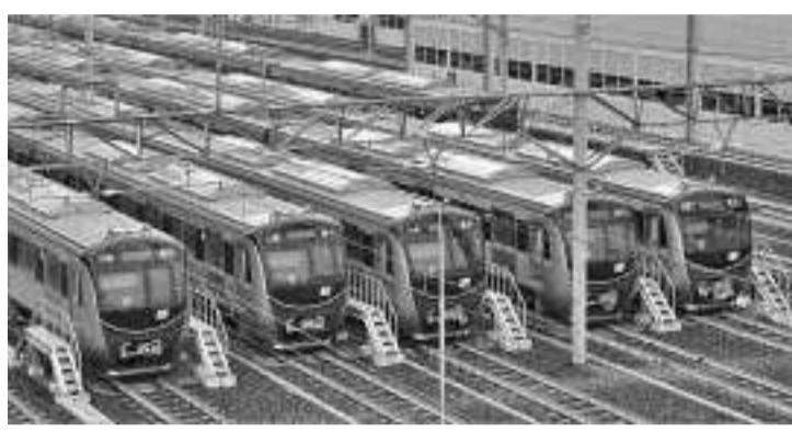
交通部计划在明年8月开始建设巴拉拉查-芝卡朗地铁线

【本报讯】交通部确保开工建设地铁东西线从巴拉拉查(Balaraja)到芝卡朗(Cikarang)的路线。