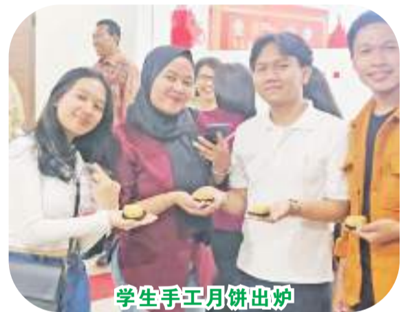
学生手工月饼出炉

夏日的微风,轻抚树枝的臂弯,2023年7月26日,一个期盼已久的日子,我们大手拉小手怀着激动的心情,终于抵达印尼三宝壟机场。先做下家庭介绍,我们来自中国深圳,爸爸是深圳市龙岗区一所公办幼儿园园长,妈妈是公办幼儿园教研员,女儿今年4岁就读中班。此行,我们将有幸在三宝壟三语学校进行一周的学术访问和交流,女儿也将开启一段奇妙的“三语学校游学之旅”。