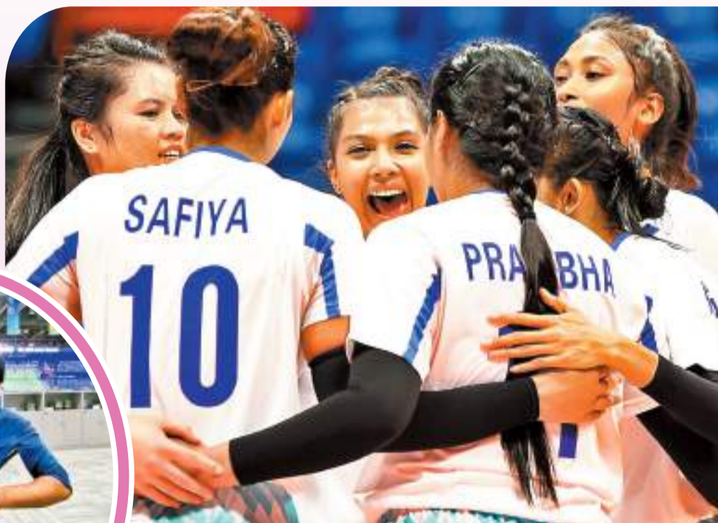
◆尼泊爾女排運動員在比賽中。 香港文匯報杭州傳真

本屆杭州亞運會獲得了大量觀眾的到場支持，熱門比賽的門票一經放出就告「售罄」，就連小組賽的現場也坐得滿滿當當。這個「十一」假期，更像是杭州及周邊城市市民的體育狂歡節，打着「飛的」來觀戰的各國體育迷們也不少。對於持票入場的觀眾而言，比賽的輸贏固然重要，但更讓他們激動的，是運動員們在賽場上表現出來的韌勁和拚勁，是敢於突破自己、創造奇跡的勇氣。