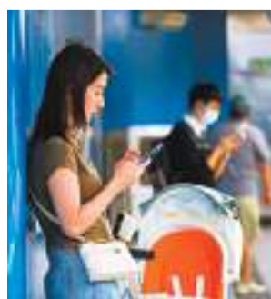
圖為市民在公共地方使用電腦。

方保僑表示，WhatsApp騙案存在已久，但「騎劫」賬號的手法卻不時更新。近期多發的個案主要涉及虛假的網頁版WhatsApp，騙徒用此手法盜取賬號，然後冒充賬號主人向其好友或群組索要錢財。「有時候用戶登陸Web版本WhatsApp，不是透過官方網站，而是用Google搜查，而Google的前兩個廣告連結有機會是假網站，用戶掃碼登陸後，騙徒在另一端已經能夠監察住對話，隨時向群組裏面的朋友理手。」他形容，有些騙案手法非常「本土化」，懷疑有本地團夥參與，「有騙徒會扮成義工，謊稱下周有活動，要求網上