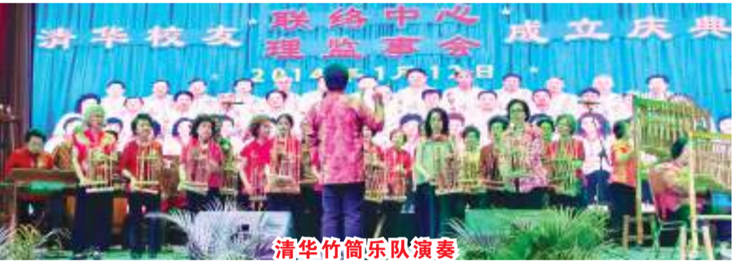
清华竹筒乐队演奏

【万隆讯】9月30日,万隆清华校友会在苏迪曼路的福清同乡基金会会所举办中秋节联欢活动,邀请了清华老师和校友们欢聚一堂,同庆中秋团圆夜。