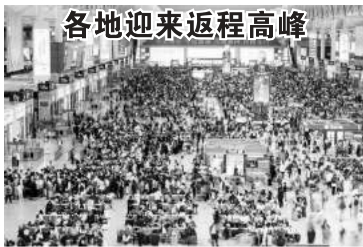
各地迎来返程高峰。10月6日，上海虹桥火车站候车大厅里人头攒动。当日是中秋、国庆长假的最后一天，全国各地迎来返程高峰。

六是优化营商环境，欢迎外商投资。加快转变政府职能，强化依法行政意识，加强信用建设，强化土地、金融、人才等要素保障，按照“审批事项最少、审批时限最短、审批流程最优、审批服务最好”的要求，努力营造一流的营商环境。