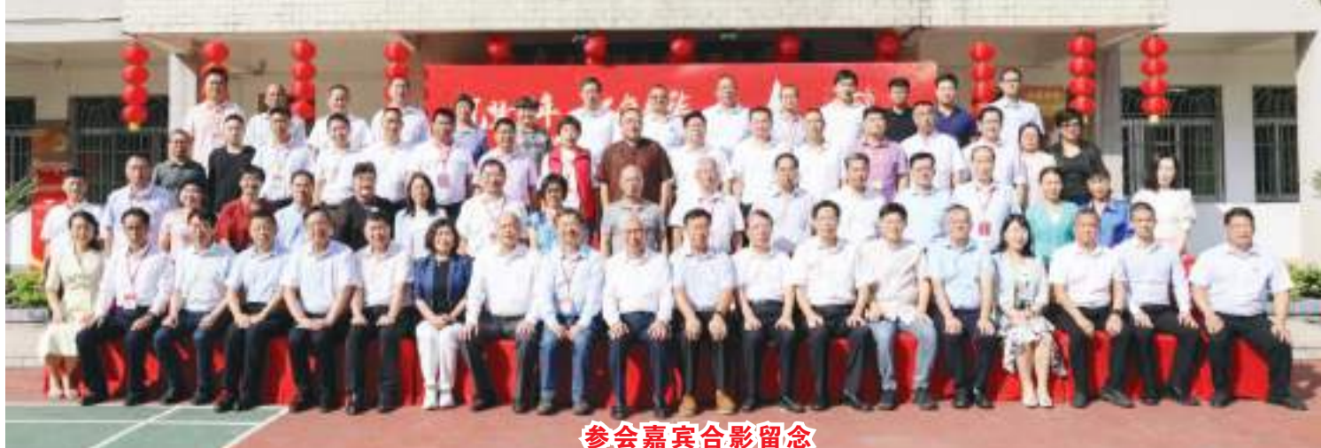
参会嘉宾合影留念