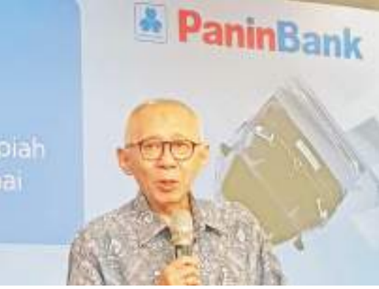
泛印银行总裁 Herwidayatmo 致辞

【本报讯】排名于印尼十大银行之一的泛印上市银行(PT BankPaninTbk, PaninBank)再度推出2023年-2024年泛印超级红运方案,向客户提供各种精彩奖品和更大赢取奖项的机会,客户有机会赢得20辆梅赛德斯-奔驰A 200和总计380亿盾的现金。