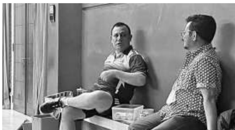
网上流传的照片。(左起)菲尔利和雅辛。

菲尔利极力否认肃贪委领导层勒索农业部长雅辛，包括与任何一方进行沟通。雅辛目前正在面临接受肃贪委调查涉嫌贪腐案件。