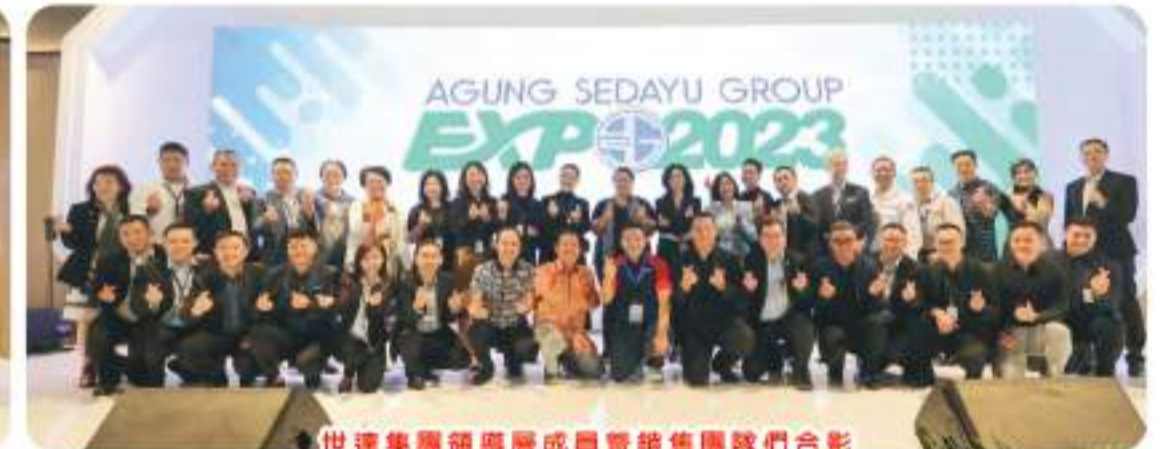
世達集團領導層成員暨銷售團隊們合影