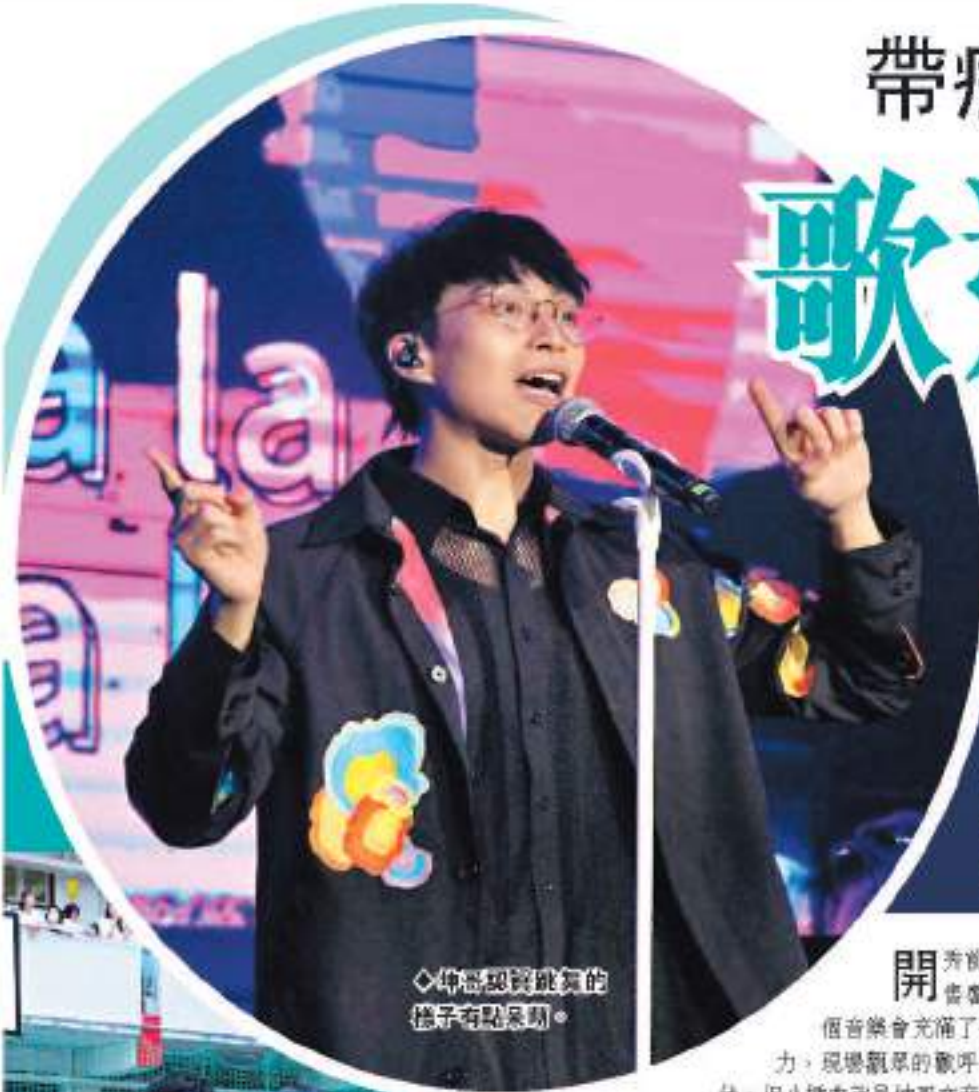
◆坤哥現狀真的慘子有點哀劇。

地址: GEDUNG GUOJIRIBAO, Jl. Gunung Sahari XI Jakarta 10720, E-Mail: koranguoji@yahoo.com 電話: (62-21)626 5566(Hunting) 傳真(廣告部): 626 1866 (編輯部): 626 1366 (發行部): 626 1766