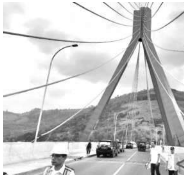
政府加强多巴湖沙摩西岛连通性 10月6日，公共工程与民居部声称，为支持苏门答腊岛和多巴湖沙摩西岛的连通性，明年政府将美化Aek Tano Ponggol大桥。