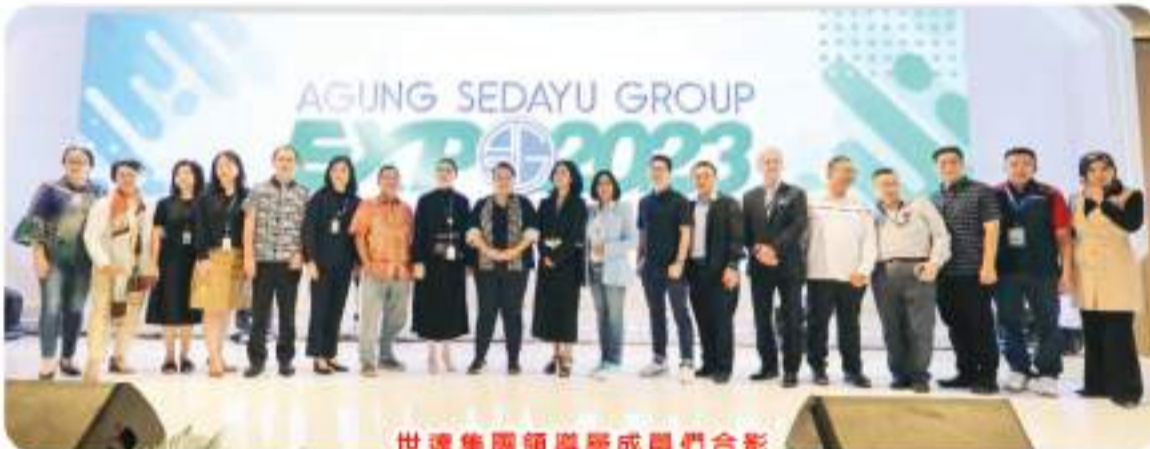
世達集團領導層成員們合影

Casa Pasadena 面向年轻家庭, 该区域距离酒店仅 3 分钟路程 2 号收费站, 住宅拥有各种区域设施, 例如价值数百亿盾的房产。配备占地 10 公顷的生态走廊, 该区域距离酒店仅 3 分钟路程 2 号收费站交汇处, 只需 30 分钟即可到达苏加诺哈达机场 (无需付费)。PIK2 本身是一座拥有世界一流设施的海滨城市, 一座拥有现代科技的综合性、智慧型、绿色城市, 房地产开发具有广阔的投资机会。#ASGEXPO2023 见!