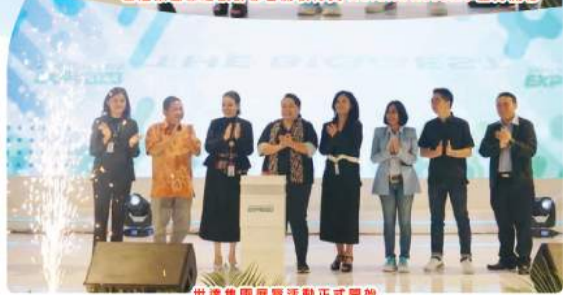
世達集團展覽活動正式開始

Casa Pasadena 面向年轻家庭, 该区域距离酒店仅 3 分钟路程 2 号收费站, 住宅拥有各种区域设施, 例如价值数百亿盾的房产。配备占地 10 公顷的生态走廊, 该区域距离酒店仅 3 分钟路程 2 号收费站交汇处, 只需 30 分钟即可到达苏加诺哈达机场 (无需付费)。PIK2 本身是一座拥有世界一流设施的海滨城市, 一座拥有现代科技的综合性、智慧型、绿色城市, 房地产开发具有广阔的投资机会。#ASGEXPO2023 见!