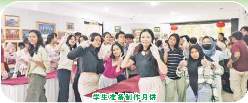
学生准备制作月饼

乌达雅纳大学旅游孔子学院自2021年4月揭牌以来,两年多的时间,孔院师生、媒体记者用一个镜头,定格了一幅幅动人的画面,令人印象深刻、难以忘怀。本次活动精选数百张照片绘制成乌大孔院主题墙,布置精美,主题鲜明,不仅展示乌大孔院历程,展现乌大孔院风貌,也成为本次活动学生的主要打卡区域。在这些照片中,其中G20期间,彭妈