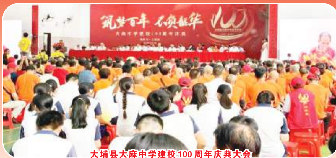
大埔县大麻中学建校100周年庆典大会