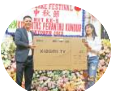
获得门奖奖品的受邀者