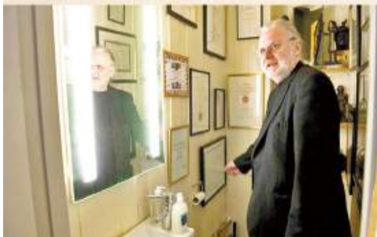
◆福瑟是挪威獲獎最多的作家之一，他將獎狀掛家中浴室。

早在今次獲獎前，福瑟已多次被視作諾獎奪獎熱門人選。瑞典文學院透露，福瑟是通過電話知悉自己獲獎，「他當時正在挪威鄉下開車，不是每個獲獎者都相信我們打的電話。」他對獲獎感到「不知所措且有些害怕」，並謙稱這只是對「以文學為第一目標」的嘉獎。福瑟將獲得1,100萬瑞典克朗獎金。