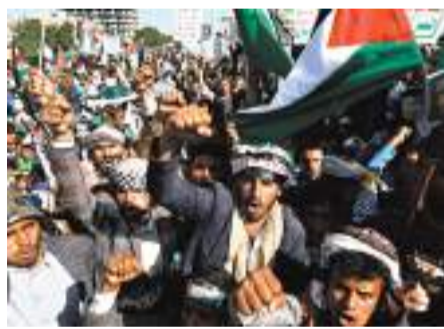
◆也門民眾抗議以軍轟炸加沙地帶。

中國政府中東問題特使翟隴13日應約，集體會見阿拉伯國家駐華使節和阿拉伯國家聯盟駐華代表處負責人。翟隴表示，中國支持阿盟在巴勒斯坦問題上發揮重要作用。下階段，中方願同阿盟和阿拉伯國家保持溝通協調，繼續做有關各方工作，為中東和平進程重回正軌不懈努力。