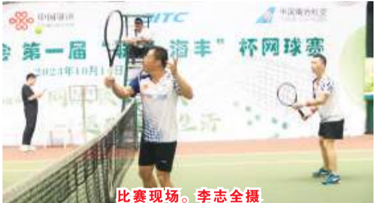
比赛现场。

进中印尼两国企业的友好合作与交流,发挥重要的桥梁和纽带作用。 商会现有会员单位260多家,包含世界500强企业以及中国国内百强、行业龙头民营企业。涵盖能源、矿产、交通运输、金融、保险、电子信息、机械、工程承包、化工及贸易等多个行业。随着中印尼两国经贸合作关系的不断加强,印度尼西亚中国商会总会在中印尼贸易合作中发挥着越来越重要的作用。