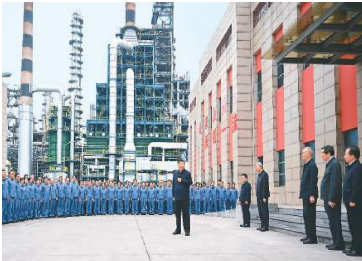
10月10日至13日,中共中央总书记、国家主席、中央军委主席习近平在江西考察。这是10日下午,习近平在中国石化九江分公司考察时,同企业员工亲切交流。