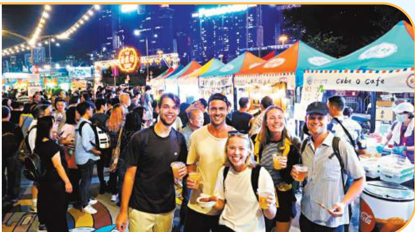
◆灣仔「海濱藝遊坊」人頭湧湧，旺丁又旺財。

「香港夜繽紛」再次舉辦夜市，14日晚7時許，香港文匯報記者到達灣仔「海濱藝遊坊」。相信由於周末的關係，場內人流明顯增加，到處人頭湧湧，現場需要實施人流管制，記者排隊10多分鐘才成功入場。現場所見，市民多數光顧特色小食為主，多個熟食檔也擠滿市民，非常熱鬧，可謂「旺丁又旺財」，同時場內有人唱歌表演增加氣氛。