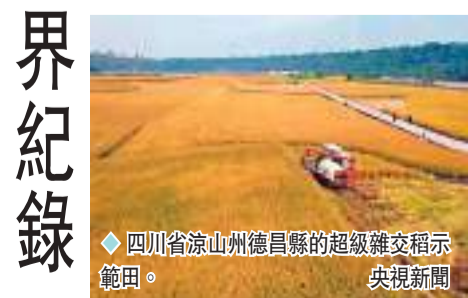
◆ 四川涼山州德昌縣的超級雜交稻示範田。

在測產驗收現場，專家組按照中國農業農村部超級稻測產方法，隨機抽取了3塊水稻田進行機械收割，機器脫粒後經測水、除雜、稱重，最終測定3塊田平均畝產1,251.5公斤，其中1號田畝產1,316.5公斤，2號田畝產1,249.4公斤，3號田畝產1,188.6公斤，3塊田平均畝產1,251.5公斤。至此，雜交水稻單季畝產實現世界新紀錄。