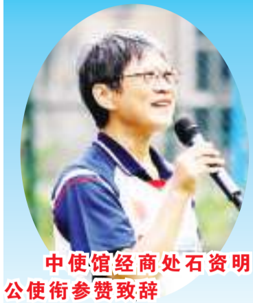
中使馆经商处石志明 公使衔参赞致辞