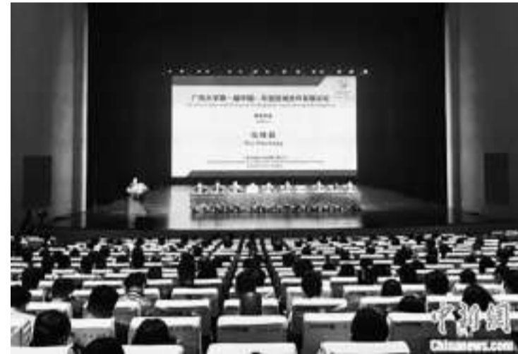
图为第一届中国—东盟区域合作发展论坛开幕式现场。

中新网南宁10月15日电10月14日至15日,第一届中国—东盟区域合作发展论坛在广西南宁举办,与会人士围绕“中国—东盟:为了更好的未来”主题开展研讨和深入交流。