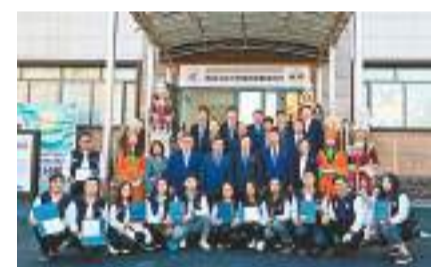
◆ 西北工業大學哈薩克斯坦分校正式啟用，圖為師生大合影。

當日的分校啟用大會在「阿里·法拉比」哈薩克斯坦國立大學圖書館大廳舉行。「哈薩克斯坦是『一帶一路』的首倡之地，分校啟用是落實中哈兩國元首晤談成果的具體行動和有益實踐，意義重大。」