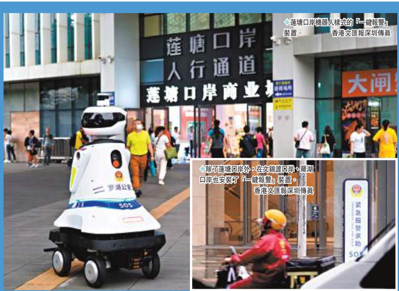
◆蓮塘口岸機器人樣式的「一鍵報警」裝置。

目前，羅湖區選取105個點位，完成試點建設和重點建設工作，現已具備群眾報警求助服務梯級響應功能。「一鍵報警」裝置已無縫融入110接處警工作體系，預計下一步將在全市普及。