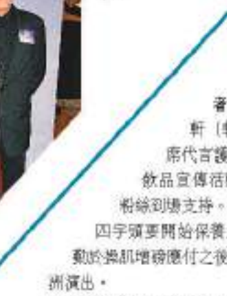
胡楓與張敬軒在紅毯上。