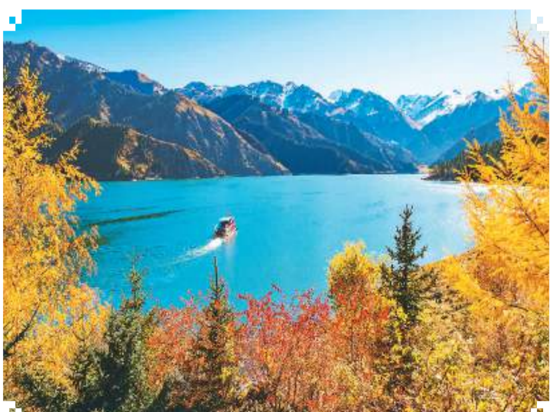
金秋十月，新疆维吾尔自治区昌吉回族自治州天山天池风景区层林尽染，秋色如画。

参会嘉宾与福建省经贸代表团围绕闽茶、建材及水暖卫浴产品、农业食品等领域经贸合作开展对接。