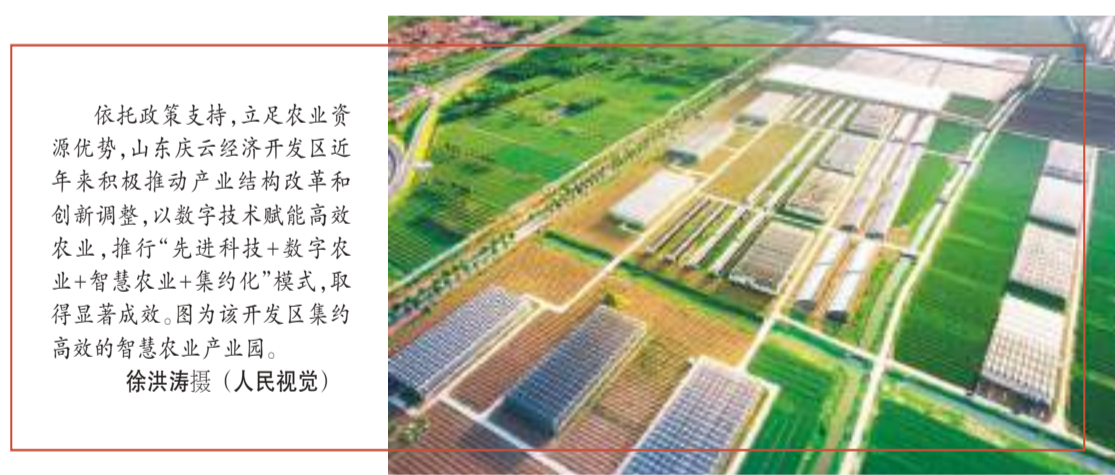
依托政策支持，立足农业资源优势，山东庆云经济开发区近年来积极推动产业结构改革和创新调整，以数字技术赋能高效农业，推行“先进科技+数字农业+智慧农业+集约化”模式，取得显著成效。图为该开发区集约高效的智慧农业产业园。

博雷利表示，中国是伟大的国家，并将发挥重要作用。中国现代化建设取得的成就不仅造福中国人民，也使全世界从中受益。愿通过此次进一步加深中欧关系，确保年底中欧领导人会晤圆满成功。