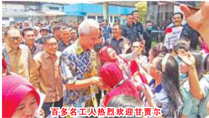
百多名工人热烈欢迎甘贾尔

他最后总结说, “当国内产业达到这样的水平时, 政府提供奖励和保护就很重要了。包括就业等方面等等。” @Nto / 明光