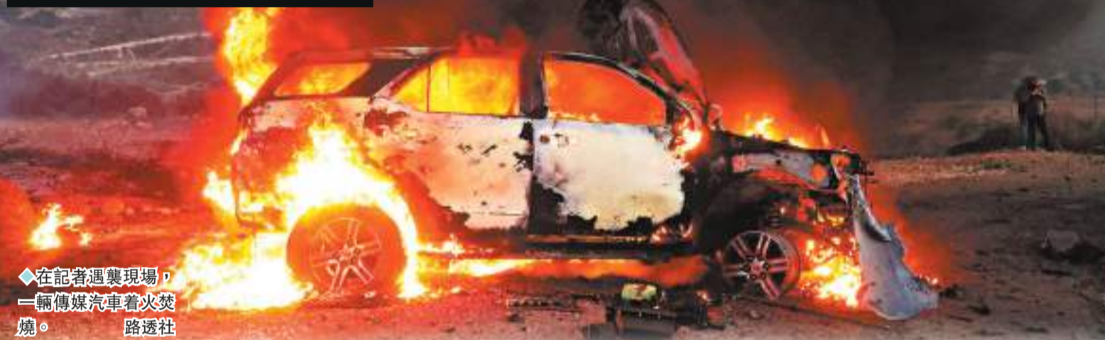
◆在記者遇襲現場，一輛傳媒汽車着火焚燒。

美國有線新聞網絡（CNN）引述消息稱，在黎巴嫩遇襲的記者當時都身穿標有明顯「傳媒」字樣的衣物。卡塔爾半島電視台記者哈希姆在場提到，「坦克炮彈直接擊中了他們（指遇襲記者），太可怕了，情況難以言喻。」半島電視台批評稱，「以色列的炮擊直接瞄準記者們乘坐的交通工具。」