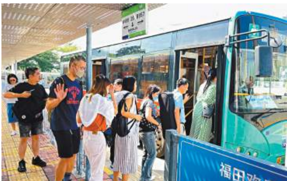
◆香港旅客正在有序上車。