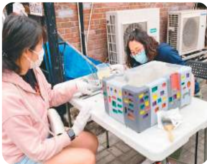
▲九龙寨城公园保留的一处遗址。 新华社记者 李钢摄 ▲九龙城区的社区街坊和游客积极参与制作水泥花盆等活动。 新华社记者 李钢摄