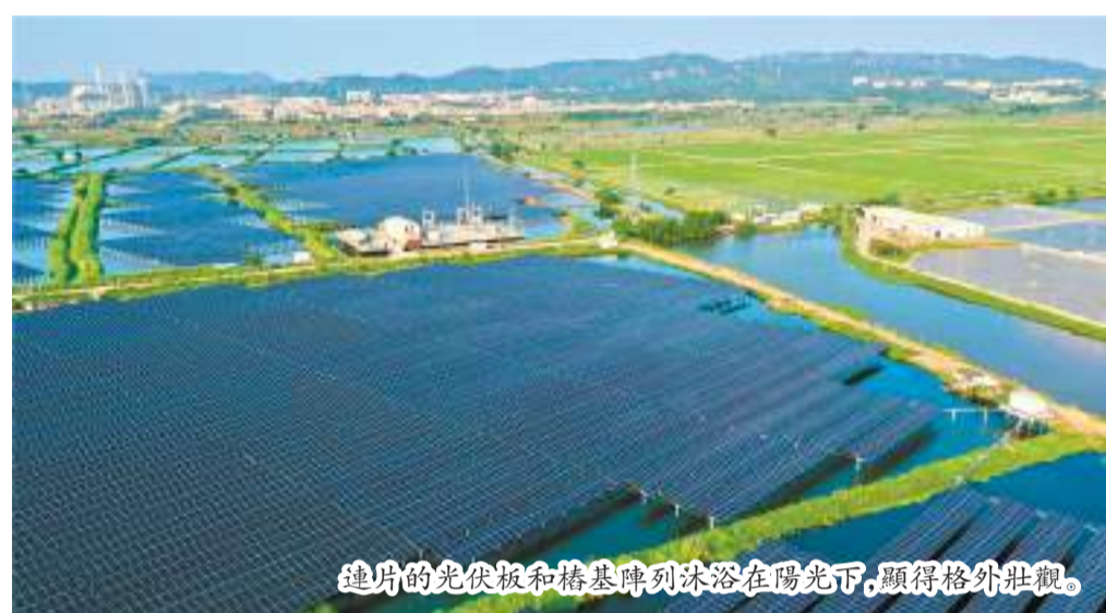
連片的光伏板和橋基陣列沐浴在陽光下，顯得格外壯觀。

金平區鮀蓮街道88兆瓦漁光互補光伏電站項目作為汕頭市集中式漁光互補新能源項目，項目投產後預計年均創稅約1000萬元，發電量可達1.2億度/年，相當于每年可解決標煤約4萬噸，減排二氧化碳約11萬噸，二氧化硫約0.33萬噸，氮氧化物約0.165萬噸，相當于華南地區約7萬畝森林的碳匯量。按2022年我國居民人均用電947度測算，可供3.2萬戶四口之家一年使用。