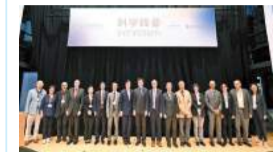
科學峰會雲集全球多位國際頂尖科學家分享前沿科學成果。

【香港商報訊】記者馮仁榮報道：由未來科學大獎基金會與香港科學院合辦的「2023未來科學大獎周」活動，於10月14日至17日首度在香港舉行。頭炮活動是為期兩日的科學峰會，雲集全球數十位國際頂尖科學家分享前沿科學成果，共同探討跨學科學術創新。