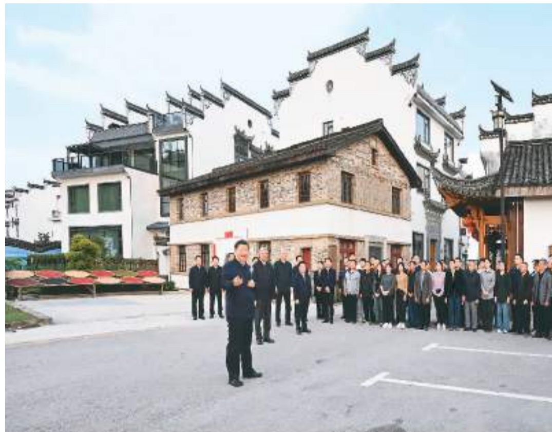
10月10日至13日,中共中央总书记、国家主席、中央军委主席习近平在江西考察。这是11日下午,习近平在上饶市婺源县秋口镇王村石门自然村考察时,同村民们亲切交流。

本报南昌10月13日电 中共中央总书记、国家主席、中央军委主席习近平近日在江西考察时强调,要紧紧围绕新时代新征程党的中心任务,完整准确全面贯彻新发展理念,牢牢把握江西在构建新发展格局中的定位,立足江西的特色和优势,着眼高质量发展、绿色发展、低碳发展等新要求,解放思想、开拓进取,扬长补短、固本兴新,努力在加快革命老区高质量发展上走在前、在推动中部地区崛起上勇争先、在推进长江经济带发展上善作为,奋力谱写中国式现代化江西篇章。