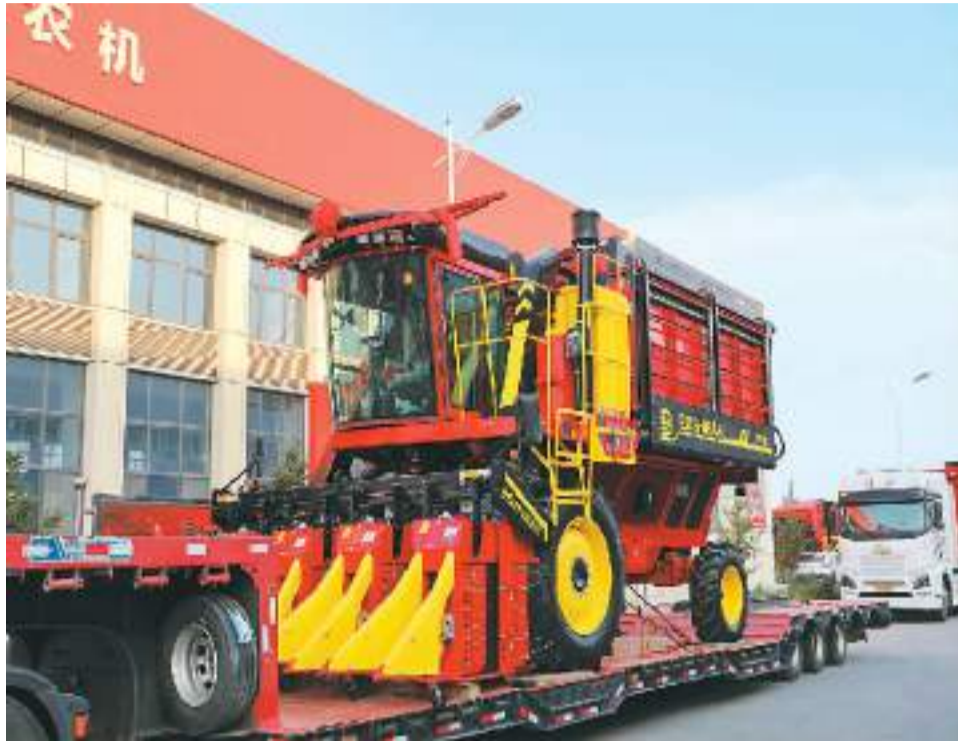
在新疆维吾尔自治区乌鲁木齐市，新疆钵施然智能农机股份有限公司生产的首批十八台四行箱式采棉机日前被运往霍尔果斯口岸，出口乌兹别克斯坦。图为等待出口的国产采棉机装在拖板上。

“一是规模稳，二、三季度进出口均在10万亿元以上，保持了历史较高水平；二是主体稳，前三季度，