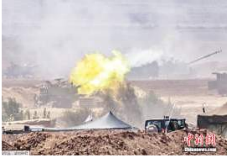
图为当地时间10月12日,以色列军队在以色列南部与加沙边界附近发射炮弹。

中新网10月15日电 综合报道,自以色列和巴勒斯坦当地时间7日爆发新一轮军事冲突以来,加沙地带局势不断升级,截至目前,巴以本轮冲突已造成双方共计近4000人遇难。