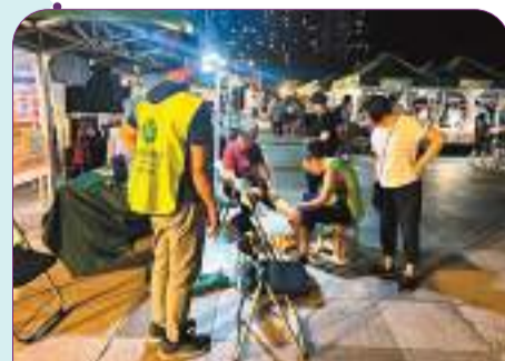
◆西環夜市現場有免費按摩體驗。

考慮多加支援創業和失業人士，給予他們開檔做生意的機會，以及提供足夠營商支援，「不少檔主都是第一次做生意，他們很多還未掌握營銷技巧，如果政府能在這方面給予支援，以及提供申請牌照等一條龍服務，就可以一舉兩得。」