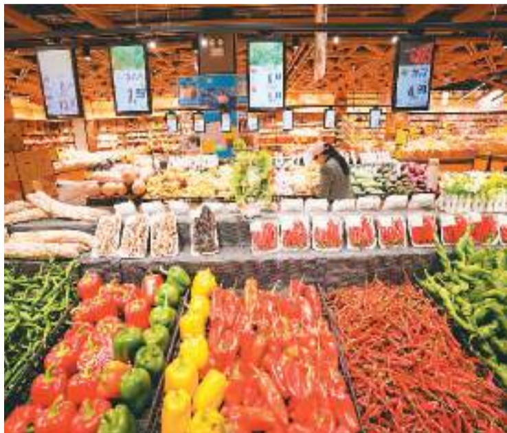
10月13日，消费者在湖南省怀化市通道侗族自治县一家生活超市选购蔬菜。

国家发展改革委副主任丛亮表示，物价低位运行，需要引起重视，但是综合物价水平、需求恢复、经济增长、货币供应量等因素来判断，中