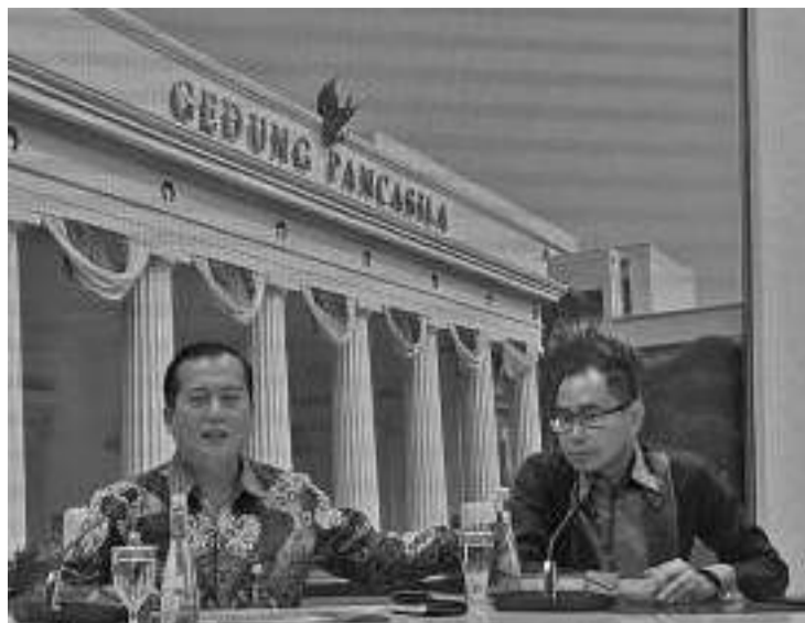
外交部发言人拉鲁·伊克巴尔(左)