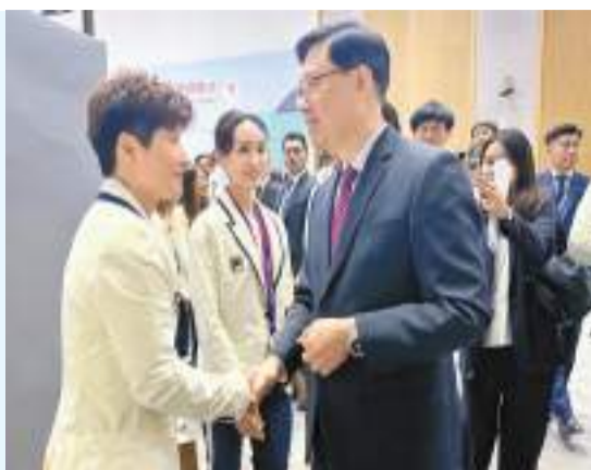
特首李家超於歡迎儀式上與港隊武術女將劉徐徐交流。中為另一武術女將陳穗津。