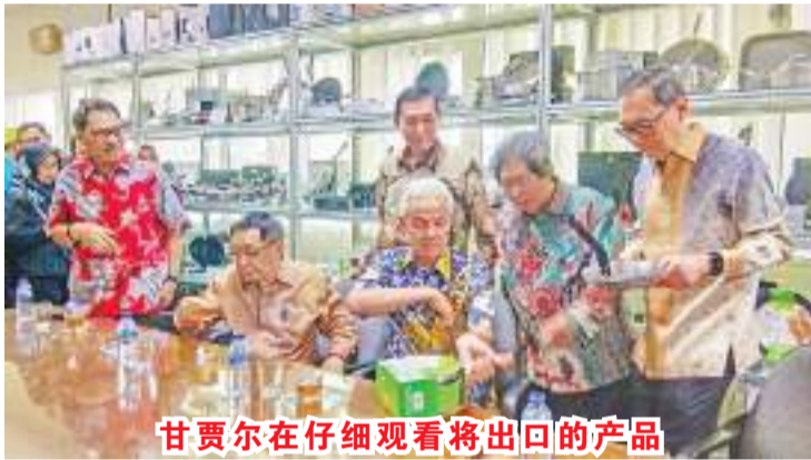
甘贾尔在仔细观看将出口的产品