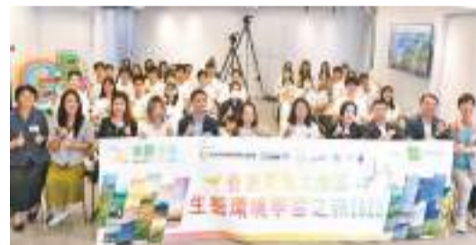
香港青年大灣區生態環境學習之旅昨日舉行啓動禮。

「丘山谷」已成為全國著名的葡萄酒莊和休閒度假旅遊區，區內有拉菲羅德、逸牛嶺等精品酒莊共7間，種植優質釀酒葡萄基地7000多畝，實現葡萄酒產業綜合收入近10億元。區內先後舉辦丘山谷酒莊超級馬拉松、農民豐收節等活動50餘場次，年均吸引遊客超20萬人次。