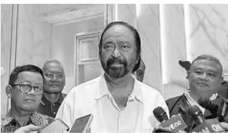
民族民主党总主席巴洛(中)

从19.15至20.00。据悉,雅辛涉嫌腐败案,即通过另外两名嫌疑人,即农业机械和设备局主任哈达(Muhammad Hatta)和秘书长卡斯迪(Kasdi Subagyono)向农业部的一些一级和二级官员筹集资金。筹集到的资金达139亿盾,是用于支付丰田阿尔法德汽车贷款,以及为雅辛的家人进行面部护理费用。