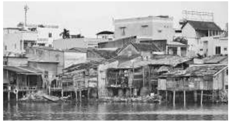
直至今年3月,我国贫困人口约达2590万人

【本报讯】2023年度,我国贫困人口情况总体下降。然而,根据中央统计局提供的数据,直至2023年3月,并非所有省份的贫困百分比都下降。7月分发布的《2023年3月印度尼西亚贫困概况》显示,我国贫困人口目前达到2590万人。与2022年9月相比,处于贫困线的人数减少了46万人;与2022年3月相比,贫困人口减少了26万人。