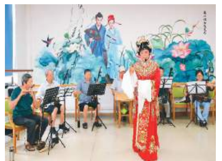
近年来，浙江省绍兴市东湖街道积极探索“志愿服务+社区居家养老”“公益慈善+社区互助养老”等模式，投资600多万元建设居家养老中心，设置戏迷角、舞蹈室、手工室、老年大学等功能性场所，满足老龄群体文体娱乐、社会参与等多元化需求。截至目前，东湖街道居家养老中心已开展各类活动1100多场。图为东湖街道居家养老中心举办的老年越剧表演现场。

今年以来，和平区持续推动假日经济发展，以产业升级引领新潮流。区内30余家老字号品牌将流行元素与中华优秀传统文化相结合，使老手艺在保持原有品质基础上推陈出新，受到很多年轻消费者欢迎，为激发当地经济活力提供了新动能。