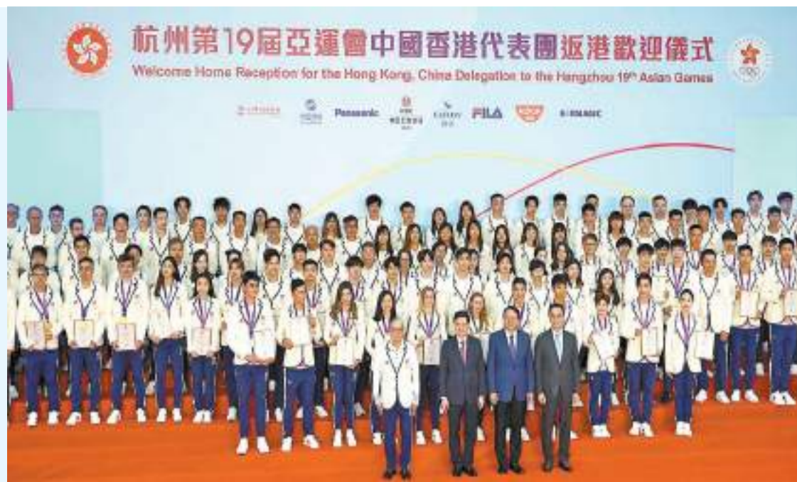
特區政府與港協暨奧委會昨日在政府總部舉行杭州第19屆亞洲運動會中國香港代表團返港歡迎儀式。