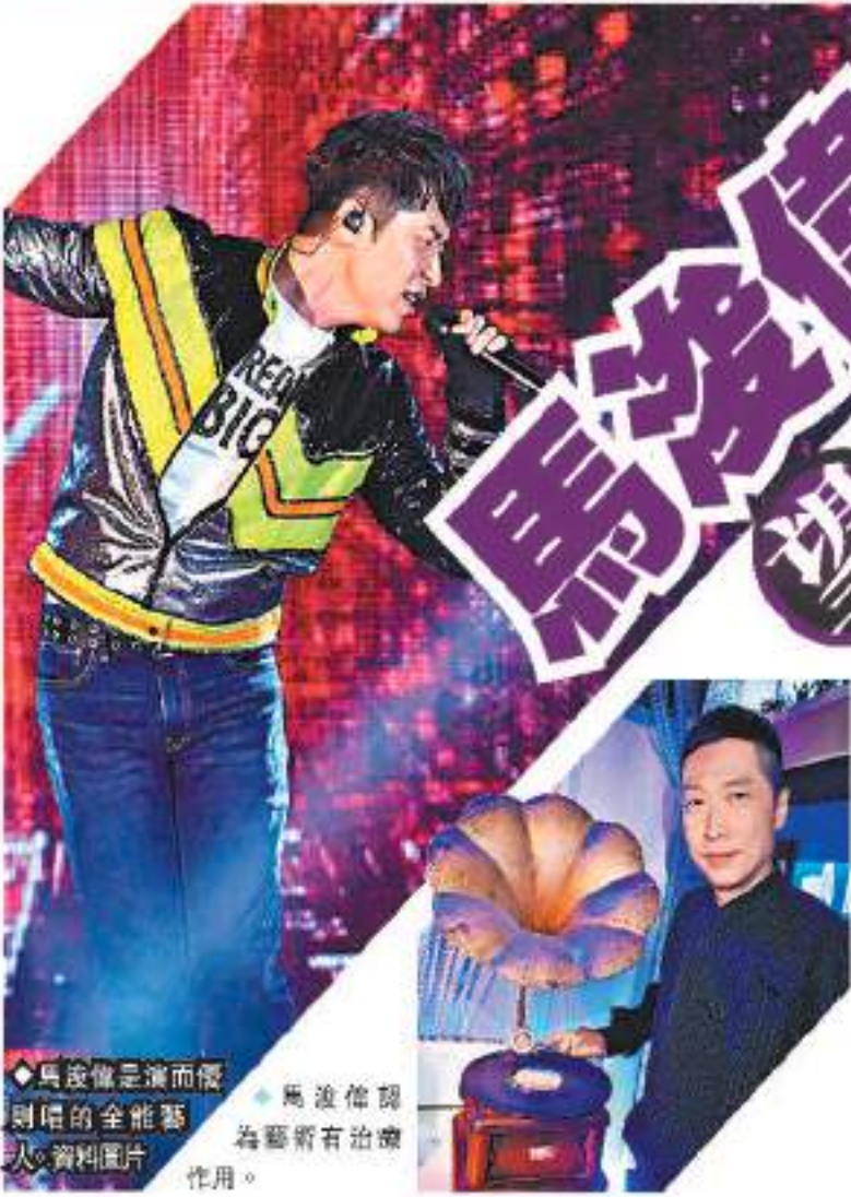
馬浚偉是演而優則唱的全能藝人。