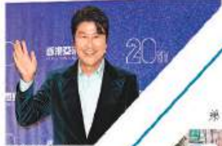
宋康昊以廣東話向大家打招呼。