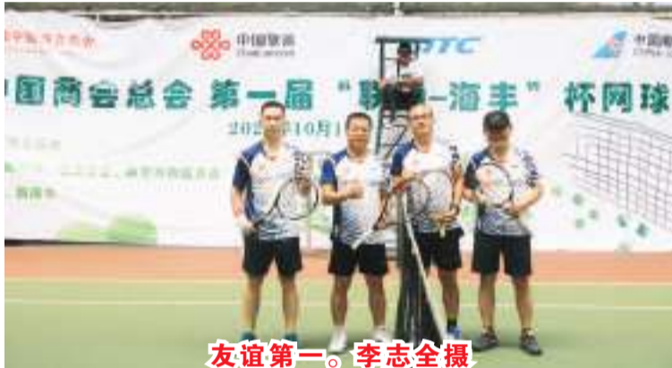
友谊第一。