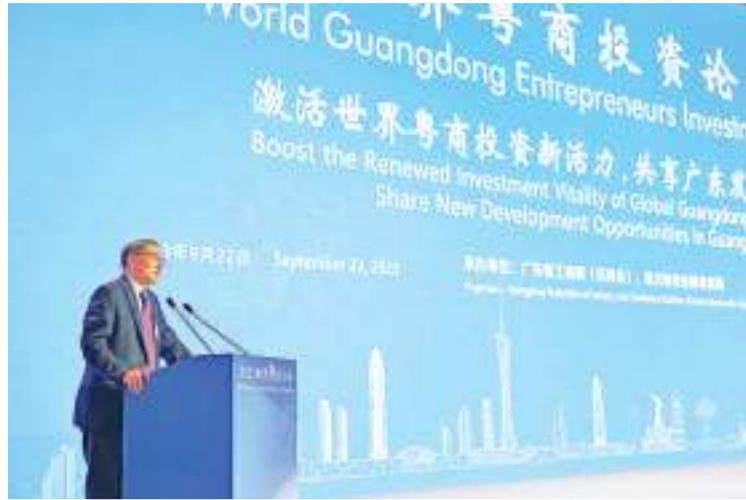
9月22日,2023世界粤商大会在广东省广州市开幕,香港中文大学(深圳)教授、前海国际事务研究院院长郑永年在大会主论坛上作主旨发言。