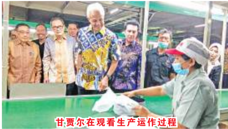
甘贾尔在观看生产运作过程