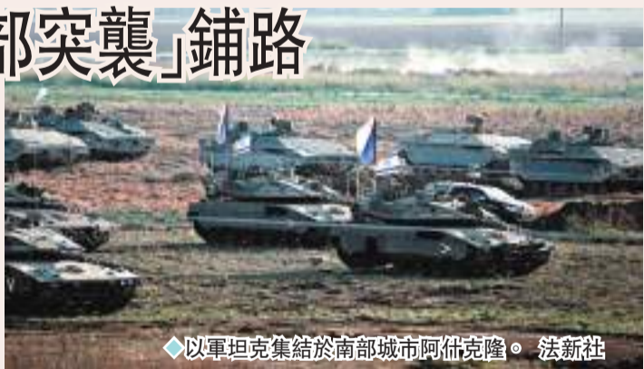
◆以軍坦克集結於南部城市阿爾克隆。

搜查並收集了有利於尋找人質的證據，擊斃多名哈馬斯武裝人員，並摧毀包括反坦克導彈發射器在內的部分哈馬斯軍事設施。哈馬斯消息人士則說，以軍聲稱的局部襲擊只是「心理戰」。黎巴嫩真主黨稱將做好充分準備，時機成熟時會協助哈馬斯共同對抗以色列。