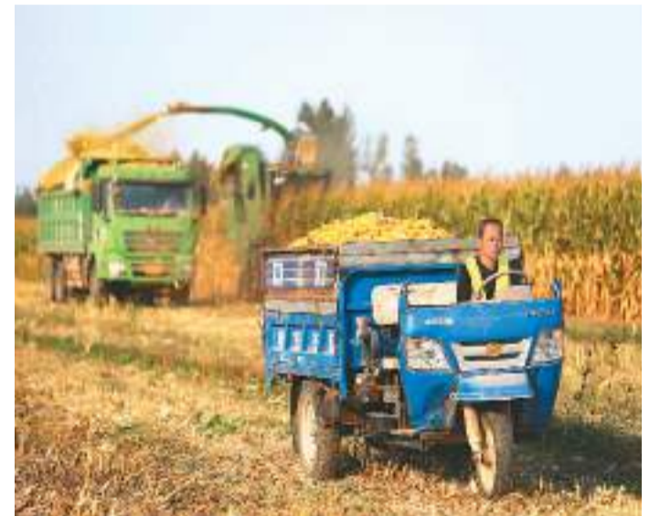
眼下，山东省乐陵市87万多亩玉米进入收获高峰，当地组织农业社会化服务组织为农户提供耕种管收“一条龙”定制化托管服务，统一实施玉米适期收割作业，确保颗粒归仓，助力农民增收。图为乐陵市农业社会化服务组织工作人员在托管粮田收获玉米。

同日发布的社会融资数据也显示，9月末社会融资规模存量为372.5万亿元，同比增长9%。前三季度社会融资规模增量累计为29.33万亿元，比上年同期多1.41万亿元。