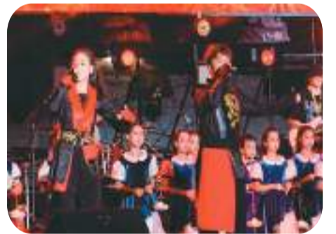
▼粤港澳大湾区吉他文化艺术展演现场。