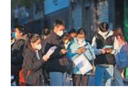
◆ 中國2024年「國考」15日開始報名。圖為參加公務員考試的考生在複習。資料圖片

香港文匯報訊（記者郭瀚林 北京報道）中國國家公務員局14日宣布，中央機關及其直屬機構2024年度考試錄用公務員報名15日開始，共計招錄職位數18,948個，招錄人數39,561人。公務員局強調，2024年公務員錄用工作將堅持把政治標準放在首位，突出把好新錄用人員政治關。並提醒廣大考生，考試無指定輔導用書，不舉辦相關輔導培訓，切勿上當受騙。