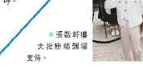
張敬軒獲大批粉絲到場支持。