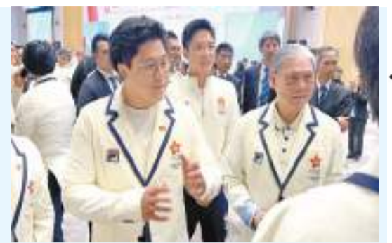
港協暨奧委會會長霍震霆(右)與亞運中國香港代表團團長霍啓剛(左)出席歡迎儀式。記者 木子攝

【香港商報訊】記者唐信恒報道：特區政府與中國香港體育協會暨奧林匹克委員會，昨日下午在政府總部舉行杭州第19屆亞洲運動會中國香港代表團返港歡迎儀式，祝賀出戰今屆亞運會的中國香港運動員凱旋回港及嘉許他們在亞運會的表現，並感謝各教練及醫療團隊的付出。行政長官李家超致辭表示，港隊在今屆亞運的精彩表現，除了反映運動員和團隊的努力，亦顯示政府大力投放資源推動體育發展，方向正確，取得成果。