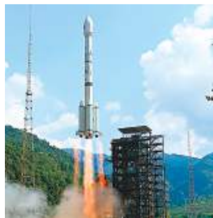
◆ 北斗三號全球衛星導航系統已為包括「一帶一路」合作夥伴在內的230多個國家和地區、超過15億用戶提供了北斗加速定位和北斗高精度服務。圖為北斗導航衛星發射現場。資料圖片

中國航天不僅「交鑰匙」，而且「帶徒弟」，為「一帶一路」合作夥伴培養本土航天人才，推動技術轉讓，建設當地航天器研製基礎設施。