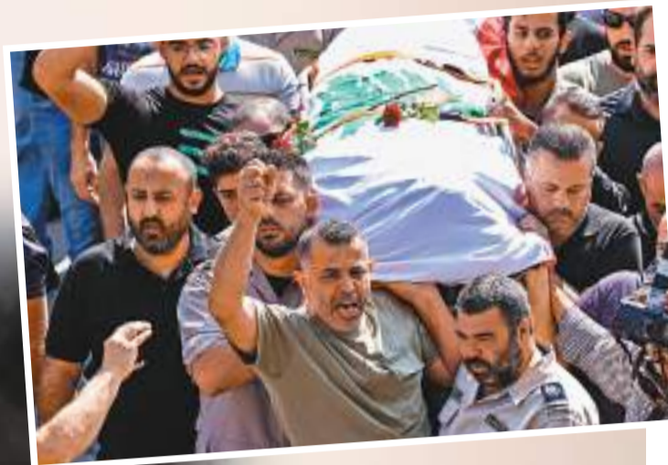
◆阿卜杜拉在其黎巴嫩家鄉舉殯。路透社

香港文匯報訊 新一輪巴以衝突已造成雙方逾3,500人死亡，當中至少11名記者殉職。多間外媒報道證實，以軍13日向黎巴嫩南部開火，造成一名路透社記者當場身亡、還有6名記者受傷。今次衝突以來，眾多記者在加沙地帶面對以軍空襲，深陷斷電斷網的危險境地，採訪還受到以國警方威脅。不過部分西方國家和傳媒都未有譴責以色列，與俄烏衝突期間極力攻擊俄方「侵犯新聞自由」的做法形成鮮明對比，盡顯雙標。