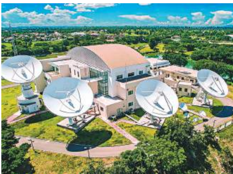
◆ 老撾首都萬象的「老撾一號」通信衛星地面站全景。

中國航天科技集團表示，將繼續強化溢出效應，推動航天產品出口高端化、系列化，用一攬子產品、服務和一體化解決方案，為「一帶一路」合作夥伴提供更加優質的服務。