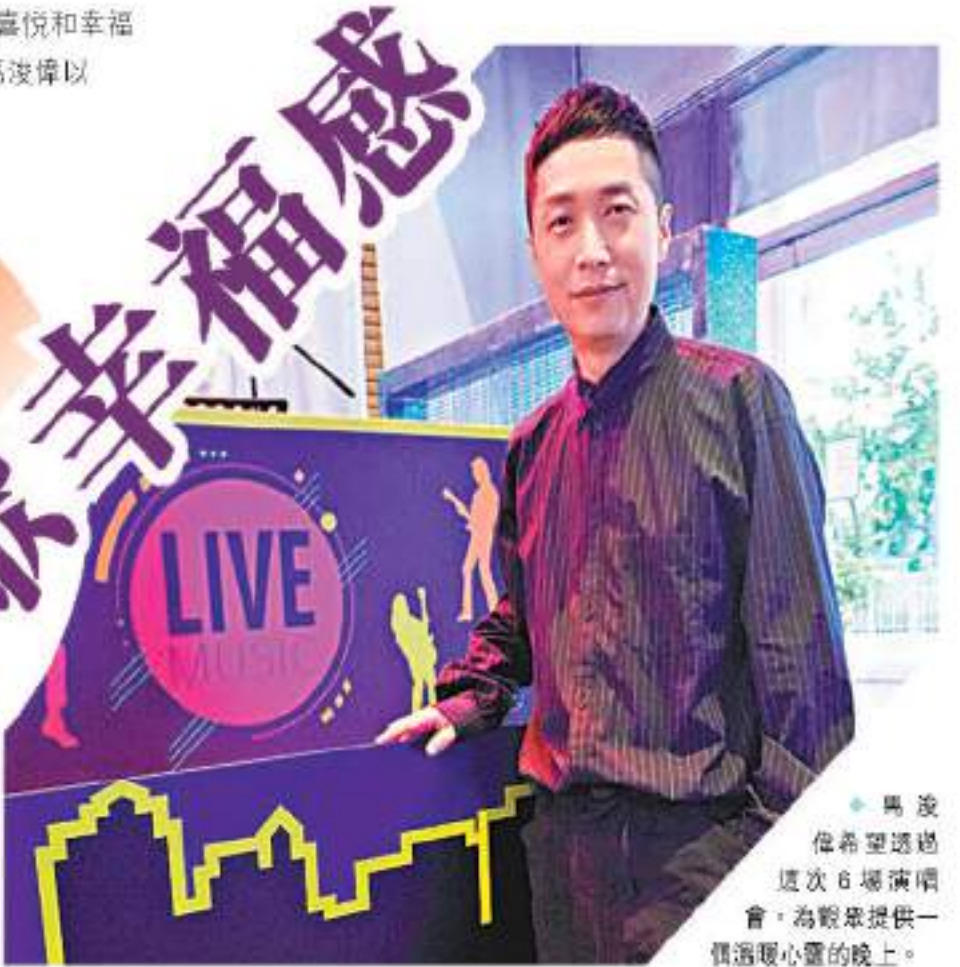
馬浚偉希望透過這次6場演唱會，為觀眾提供一個溫暖心靈的晚上。