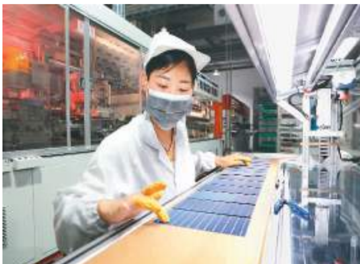
江苏省泗洪县近年聚焦新能源领域，加快构建完整光伏产业链，推动相关产品出口德国、荷兰等市场。图为10月13日，泗洪经济开发区一家公司生产车间内，工人在赶制光伏组件产品。

中国有进出口实绩的外贸企业增至59.7万家，其中2020年以来持续活跃的企业进出口值占整体的近八成；三是份额稳，前7个月，中国出口国际市场份额与去年同期基本持平。”吕大良说。