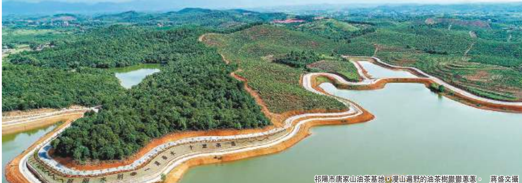
祁陽市唐家山油茶基地，漫山遍野的油茶樹鬱鬱蔥蔥。

立足新時代新征程，祁陽市將深入貫徹落實習近平總書記關於油茶產業發展的重要講話和指示精神，按照祁陽市油茶產業發展「十四五」規劃及2035年遠景規劃，持續推進油茶新造、低改，支持經營主體做大做強，構建完善「三群四帶」產業建設布局，「三群」即打造以八寶、肖家，三口塘、茅竹、觀音灘，潘市、梅溪、羊角塘等鎮為主的三個油茶產業群，「四帶」即建設泉南高速、356國道、322國道、湘桂鐵路沿線四條油茶產業帶，力爭到2035年，全市油茶林面積達到100萬畝，其中高產油茶林50萬畝，油茶綜合產值突破100億元，着力將油茶產業打造成促進群眾增收的民生工程、生態宜居的綠色工程、鄉村振興的特色工程，為全省探索更多可借鑒、可複製、可推廣的祁陽經驗。