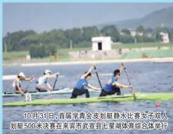
10月31日,首届学青会皮划艇静水比赛女子双人划艇500米决赛在来宾市武宣县七星湖体育综合体举行