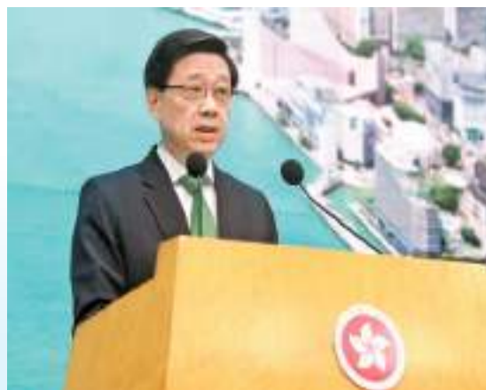
李家超表示，今年金融領袖投資峰會更勝往年。

談到亞太經合組織(APEC)會議時，李家超表示，財政司司長陳茂波說過會向出席會議人士介紹香港的優勢、吸引力和商機和潛力，並會擴大香港的朋友圈。他續說，本港十分強調自由貿易、協作