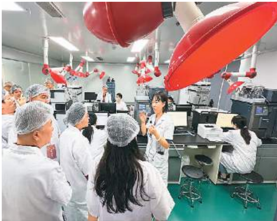
图为研习班学员在江苏省中医院马鞍山井泉中药炮制基地参观。

从讲座课堂到中药工厂，从中医院诊室到中草药基地，从博物馆到康养谷，研习班学员跟随中医药专家，享受中医“进阶”之旅。