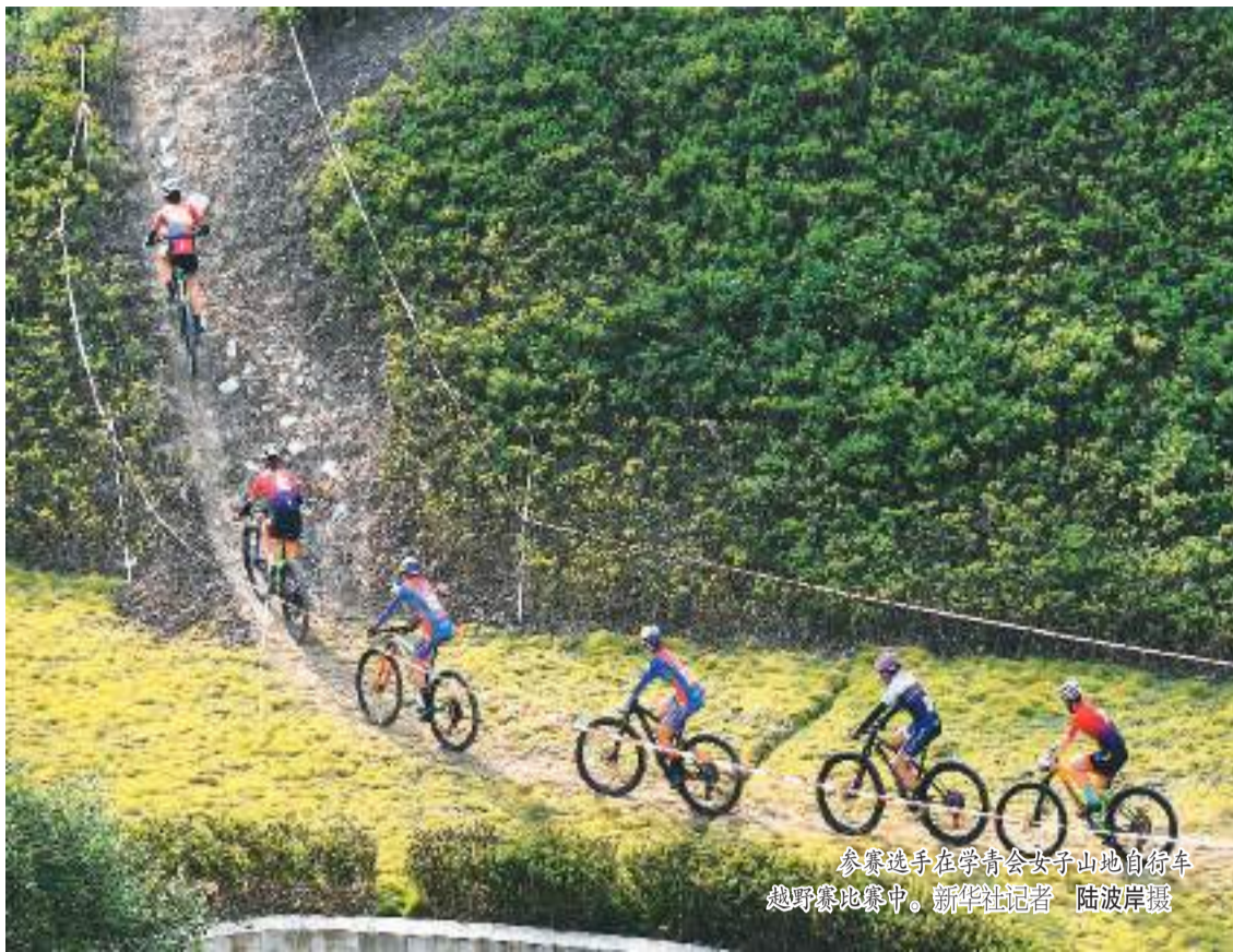
参赛选手在学青会女子山地自行车越野赛中。