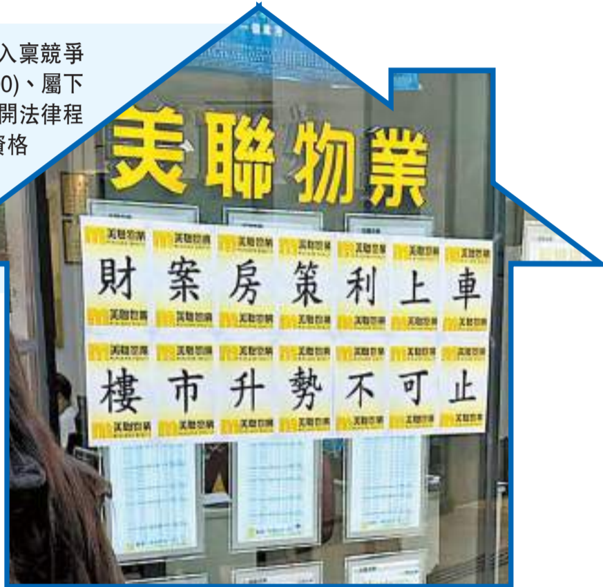
競委會入稟指控美聯集團及旗下地產代理商美聯物業、香港置業與美聯5名高層合謀訂最低佣金。

【香港商報訊】記者鄭珊珊報導：競爭事務委員會昨日入稟競爭事務審裁處，就中原美聯涉嫌合謀定價案件向美聯集團(1200)、屬下美聯物業及香港置業(統稱「美聯」)，以及美聯5名高層展開法律程序，要求審裁處施加罰款；向美聯5名高層發出取消董事資格令；以及美聯須推行審裁處認為合適的有效合規計劃等。另一方面，中原集團全面與競委會合作，以換取競委會不對中原及其高級人員或僱員展開任何法律行動，雙方已簽訂寬待協議。