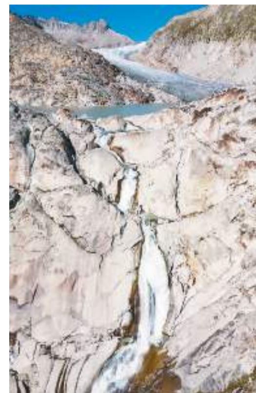
受全球气候变暖影响，瑞士冰川不断消融。图为近日在瑞士罗纳冰川拍摄的冰川融水。