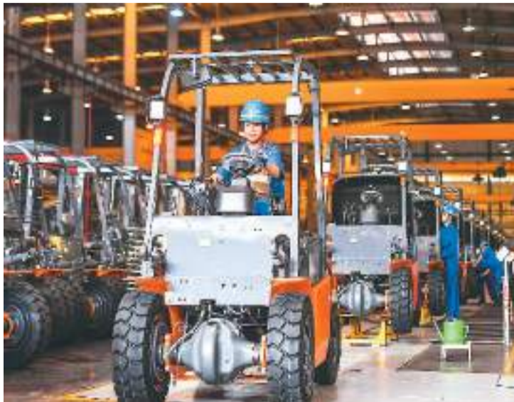
推动经济增长重要力量，民营经济发展态势备受关注。

贡献50%以上税收、60%以上GDP、80%以上城镇就业……占据国内生产总值半壁江山，作为