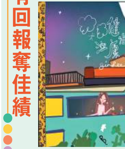
Gin Lee以動畫方式呈現新歌MV。

劉德華明年內地開騷 主辦方發聲明防公眾受騙 香港文匯報訊（記者阿祖）劉德華（華仔）內地巡迴演唱會將於明年在內地多個城市舉行，並擬定於明年7月至9月陸續在上海、廣州、北京、南京、杭州、成都、深圳及重慶演出。過去華仔曾於2011年及2013年均在內地巡迴演出，原定2021年於廣州、上海及北京的巡迴卻因疫情取消，今次相隔超過10年再於內地舉行演唱會，對於華仔的粉絲來說，實在是天大的喜訊。但由於籌備演出以來，據知有一些製作公司渾水摸魚自認負責劉德華內地演唱會之製作欺騙，有見及此，華仔內地巡迴演唱會之主辦單位「紅地毯控股」於13日發出聲明：「紅地毯控股有限公司已獲得亨泰環宇有限公司授權，獨家舉辦《劉德華2024年中國內地巡迴演唱會》的權利。本公司獲悉近日坊間就該演唱會有不同說法和揣測。為釋各方疑慮，避免公眾受騙，本公司現聲明，本公司只授權ROCKET CITY ENTERTAINMENT LIMITED為該演唱會的主辦方。此授權由即日起至2024年11月30日止。」