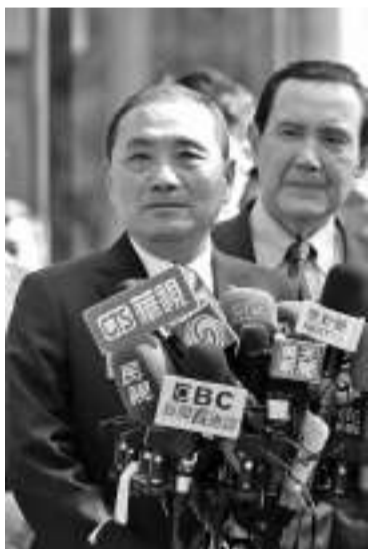
11月15日，中国国民党、台湾民众党在台北举办政党协商会，新北市市长侯友宜会后接受媒体采访。

中新社台北11月15日电 中国国民党、台湾民众党15日就两党参与2024年台湾地区领导人选举候选人确定方式等达成共识，将于18日公布结果。