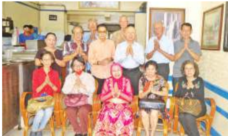
哈查李碧英与校友及亲属合影

参加本次活动的校友平均年龄超过70岁。大家都热情高涨,踊跃参与,活动在友好的气氛中进