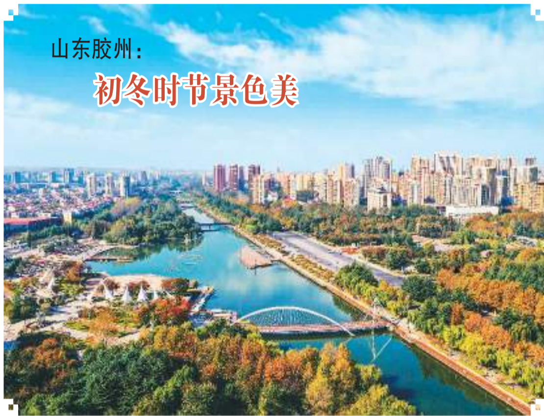
山东胶州：初冬时节景色美

初冬时节，山东省胶州市三里河公园层林尽染，与城市建筑群、蓝天碧水等相互映衬，美不胜收。