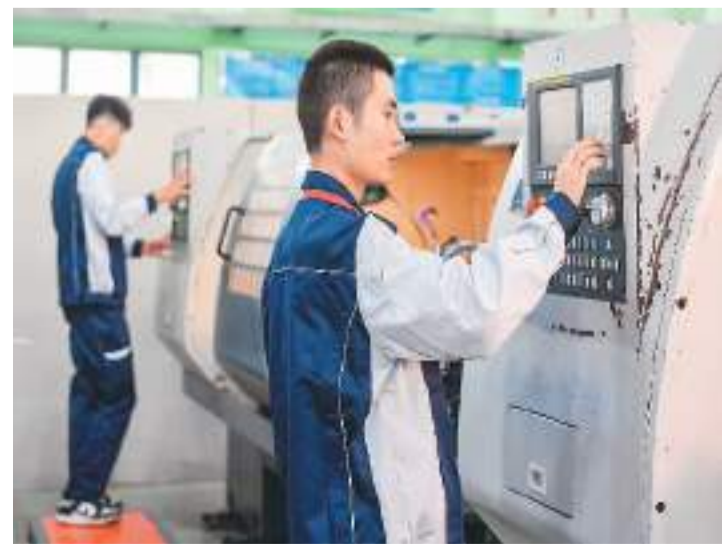
近日,皖台职工技能竞赛交流活动在安徽省马鞍山职业技术学院举办。本次技能竞赛交流活动由安徽省总工会、安徽省皖台交流协会、台湾中华劳工同盟总工会等共同举办,72名皖台选手同台竞技,展示了精湛技艺。图为安徽与台湾职工在车床工种技能竞赛中参加比赛。

近年来,驻澳门部队积极参与慰问老幼、无偿献血、公益捐款等澳门社会公益活动,为澳门社会事业贡献力量。