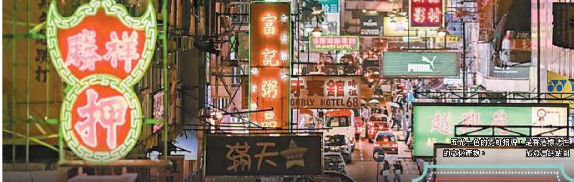
五光十色的霓虹招牌，是香港標誌性的文化產物。

【香港商報訊】記者周偉立、林駿強報道：霓虹招牌是香港標誌性的文化產物，為了保障樓宇安全，屋宇署引進招牌監管制度，對危險及違例招牌發出法定清拆命令。昨日，有內地網民在社交媒體發文聲稱香港引入「內地城管辦法」，將霓虹招牌統統拆掉，並配上多個霓虹招牌被裝上貨車運走的圖片，隨即引起網民熱議。不過，經查證後發現，網民發布的圖片，有部分經後期（P圖）處理，並非真實照片。事實上，小型招牌（含霓虹招牌）只要符合相關安全要求，是可以繼續使用的。屋宇署發言人回應本報查詢時亦強調，署方並沒有針對霓虹燈招牌的大規模執法行動。