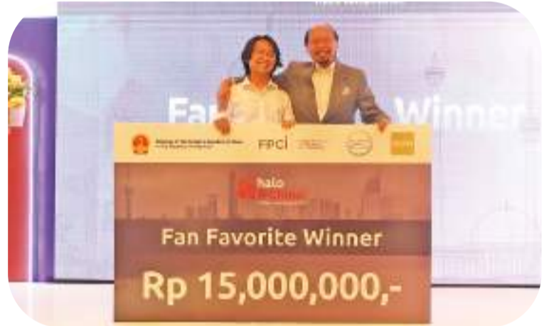
印尼外交政策协会高级研究员索马迪(Soemadi)大使为网络人气奖获得者颁奖

第四届“你好,中国!”短视频大赛,聚焦中印尼两国政治、经济、人文交流、“一带一路”倡议等话题。大赛于今年7月启动,最终从300多幅作品中评选出一、二、三等奖,网络人气奖、优秀奖、参与奖。