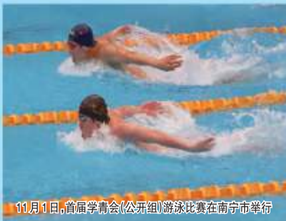
11月1日,首届学青会(公开组)游泳比赛在南宁市举行