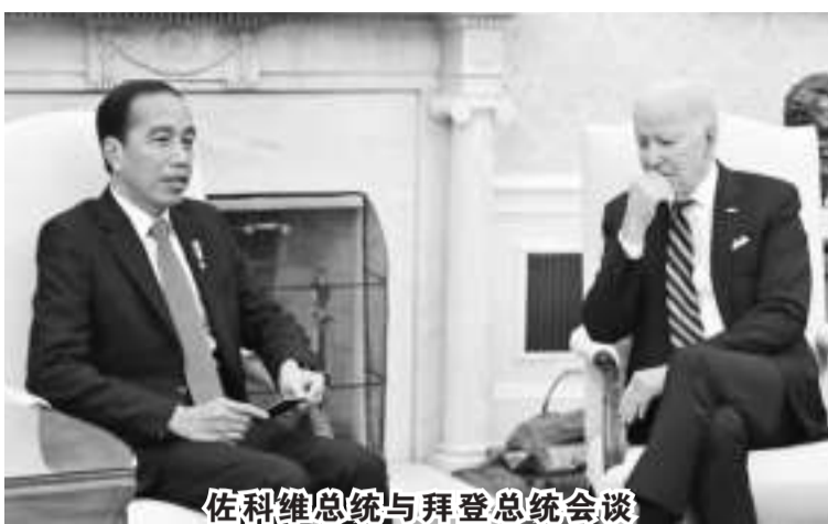
佐科维总统与拜登总统会谈

【本报讯】在华盛顿特区白宫，佐科维总统与拜登总统会晤时，就印尼与美国两国政府间合作的六份文件达成一致，其中包括关于建立全面战略合作伙伴关系的协议。 11月15日，引述总统秘书处YT频道发布的声明，外交部长蕾特诺表示，双方同意在多个领域进行合作，即在卫生、能源和矿产资源、海事和文