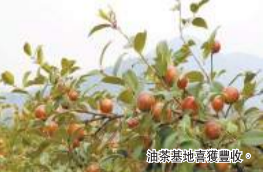
油茶基地喜獲豐收。

突出企業帶大戶、大戶帶散戶，加快老油茶林撫育改造、油茶幼林撫育、油茶中林品種改造和更新改造、高產油茶新造，推動油茶基地漫山遍野處處開花。 企業大力「建」。積極走出去、請進來，引進大企業、好項目落地祁陽，建設高產油茶基地。市財政對油茶新造每畝補助1000元。近年來，引進央企中林集團、國企廣墾集團、港資企業唐家山公司以及深圳大嶺、湖南油谷高科等10個知名糧油企業入駐，促進新金浩、御沁園、顧君、祁旺、科元盛等本土企業做強，全市年均實施新造良種油茶1.5萬畝以上，累計建設高產油茶基地35.1萬畝，萬畝連片油茶基地6個。 農戶積極「改」。用好用活油茶產業發展資金，對納入計劃範圍內的老油茶林撫育改造獎補500元/