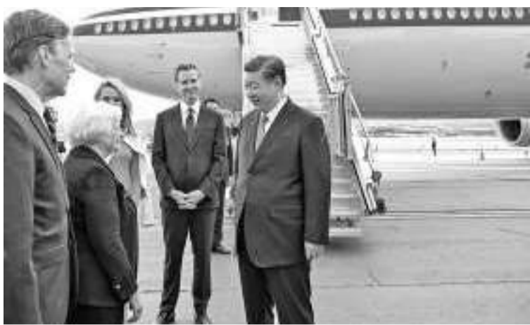
习近平乘坐专机抵达旧金山国际机场时，受到美国加利福尼亚州州长纽森、财政部长耶伦等美方代表热情迎接。

当地时间11月14日下午，中国国家主席习近平乘专机抵达美国旧金山，应邀同美国总统拜登举行中美元首会晤，同时应邀出席亚太经合组织第三十次领导人非正式会议。