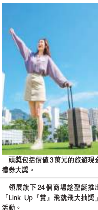
頭獎包括價值3萬元的旅遊現金禮券大獎。