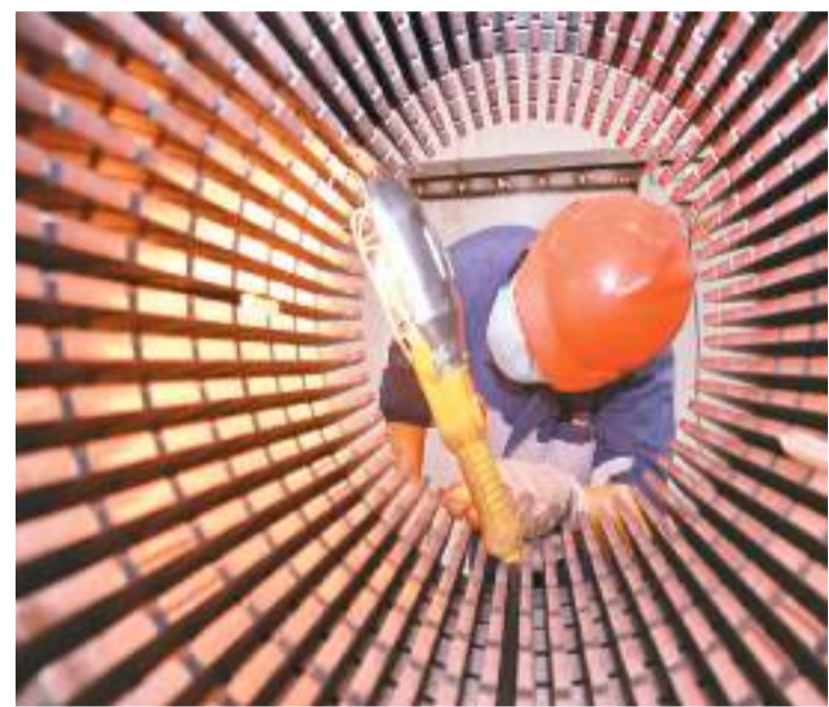
工人在江苏省南通通达砂钢冲压科技有限公司生产车间忙碌。

据悉，本次推进会上揭牌的“金融支持制造业绿色转型研究中心”，在江苏银行总部落地成立。此外，在推进会上还促成了17个项目签约，以及10个绿色转型项目和创新金融产品的推介对接。