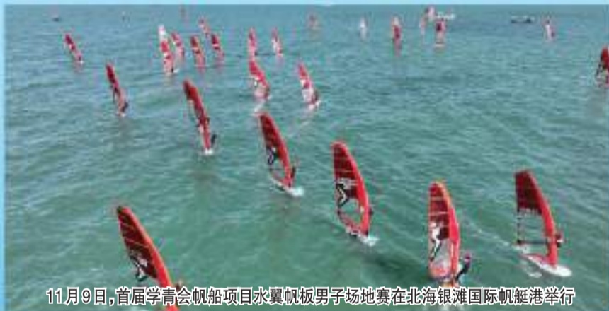
11月9日,首届学青会帆船项目水翼帆板男子场地赛在北海银滩国际帆船港举行