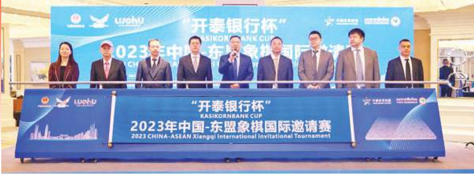
开泰银行杯·2023年中国-东盟象棋国际邀请赛开幕式