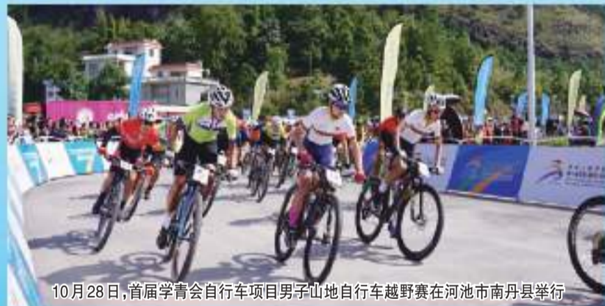
10月28日,首届学青会自行车项目男子山地自行车越野赛在河池市南丹县举行