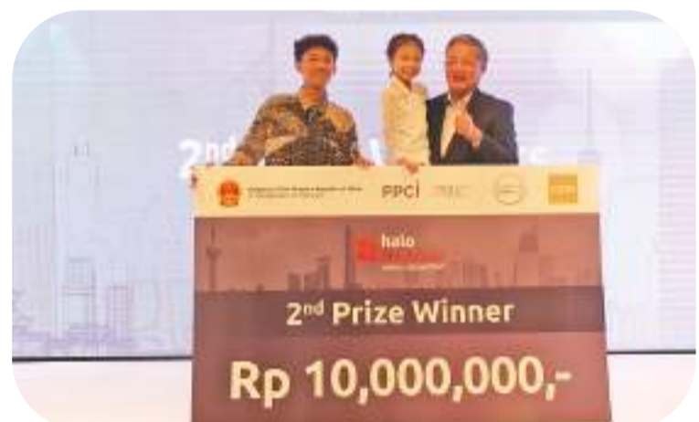
中国公共外交协会副会长胡正跃为两位获得二等奖的选手颁奖