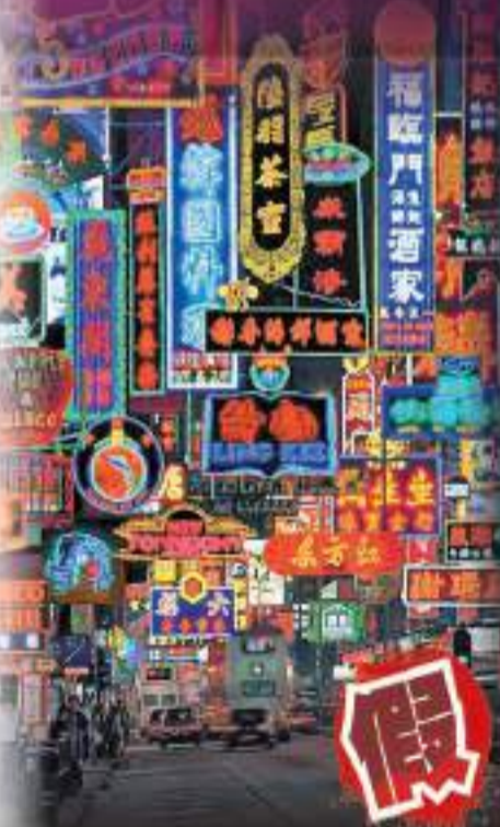
網上另一張流傳的照片，是車流在五光十色的霓虹招牌下穿梭，其實這幅作品是由英國攝影師將香港各地的多張霓虹招牌照片拼接後製作而成。