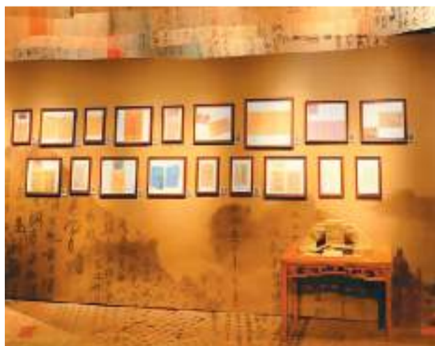
图为展览展出的江门五邑侨批。

近日，“侨批中的党史——江门侨批活化研究成果展”在中国华侨历史博物馆展出。展览对一些具有代表性的广东江门五邑侨批进行深度解读，呈现其背后的动人故事。咫尺素笺，字里行间，不仅有家长里短，还有深沉的家国情怀。