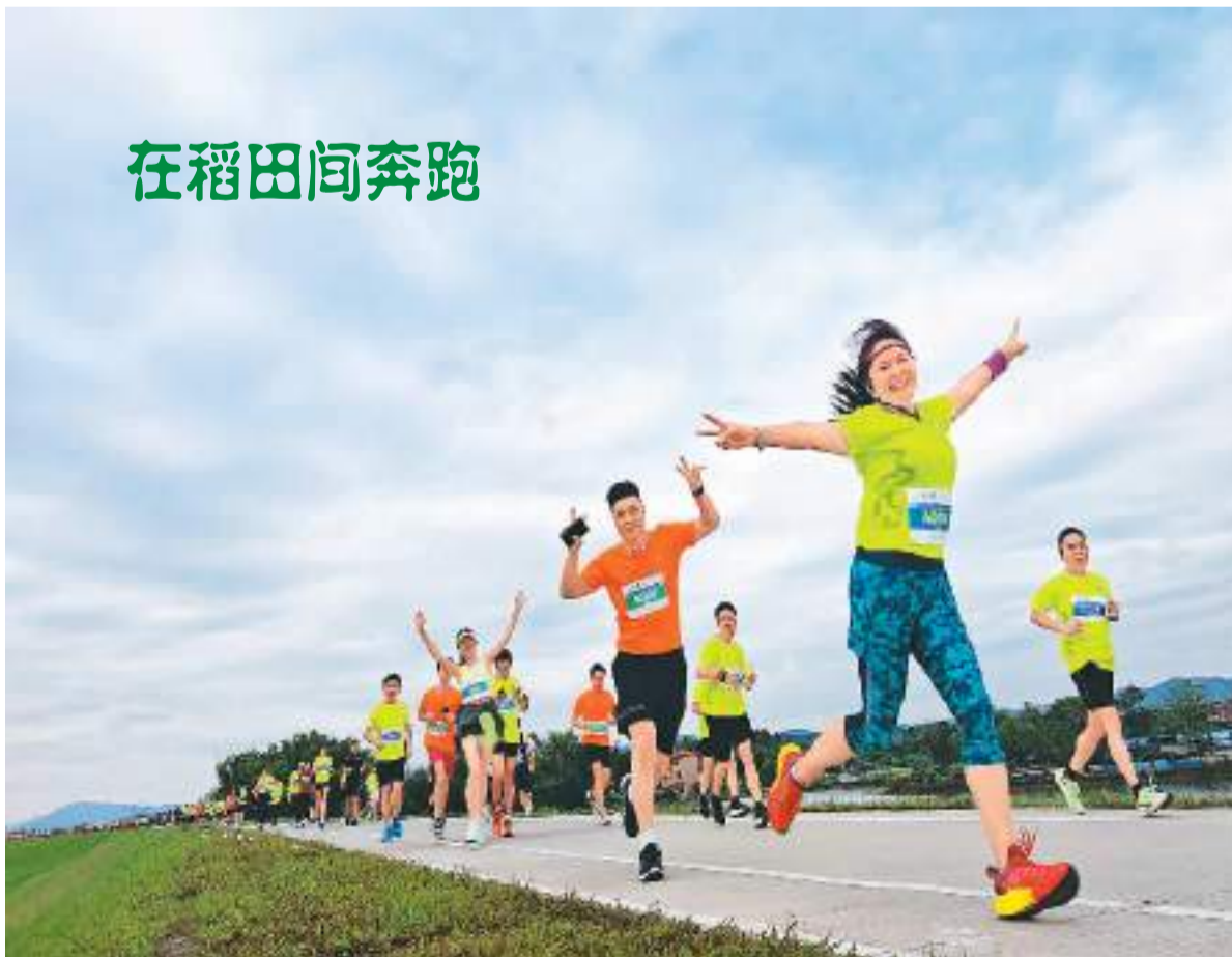
近日，一场乡村半程马拉松在广东佛山高明区举行。约5000名来自各地的跑友在稻田间奔跑，体验运动的快乐。