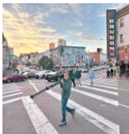
◆攝影記者諾塞克被匪徒用槍指着腹部。

香港文匯報訊 捷克電視台探訪隊在美國舊金山探訪APEC會議期間，遭3名持槍匪徒搶劫，被搶走價值逾1.8萬美元（約14萬港元）的攝影器材，此前拍攝的檔案也被搶走。舊金山警方表示正全力調查此案。