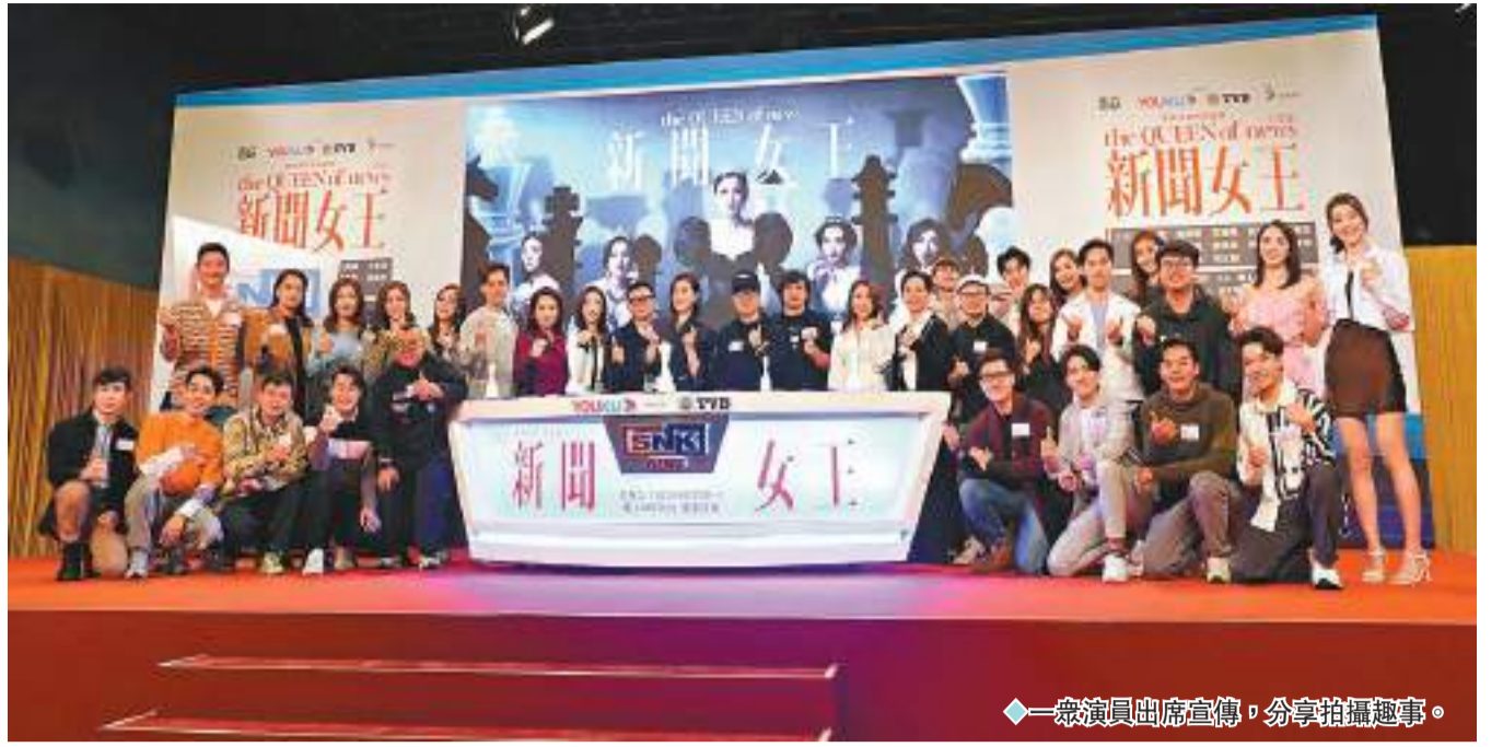
一眾演員出席宣傳，分享拍攝趣事。