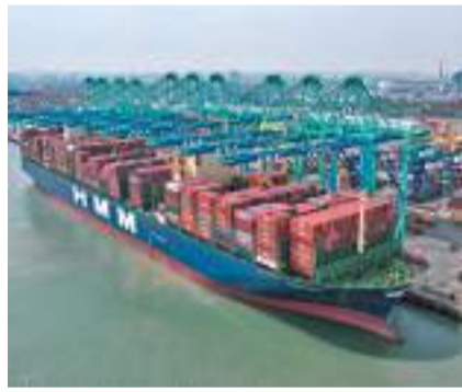
◆中美提供全球40%以上商品和服務。圖為天津港。