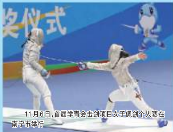
11月6日,首届学青会击剑项目女子佩剑个人赛在南宁市举行