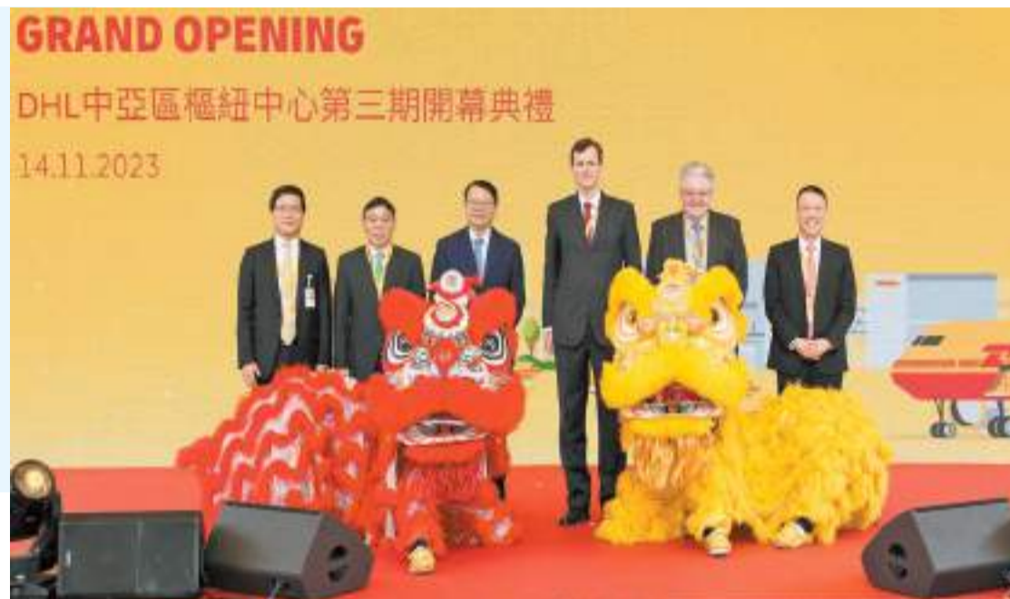
陳國基（左三）及其他主禮嘉賓主持醒獅點睛儀式。

【香港商報訊】記者唐信恒報導：國際速遞公司DHL Express位於香港國際機場的中亞區樞紐中心第三期擴建部分，昨日正式啟用。據介紹，該擴建工程涉款3.77億歐元（約32億港元），總倉庫面積約4.95萬平方米，公司預計總貨運量每年可達到106萬噸，每小時可處理12.5萬件貨物，較擴建前增加七成。政務司司長陳國基致辭時提到，樞紐中心的擴建，支持香港國際機場由「城市機場」發展成為「機場城市」，進一步提升香港國際機場的貨運處理能力，攜手邁向長遠的目標。