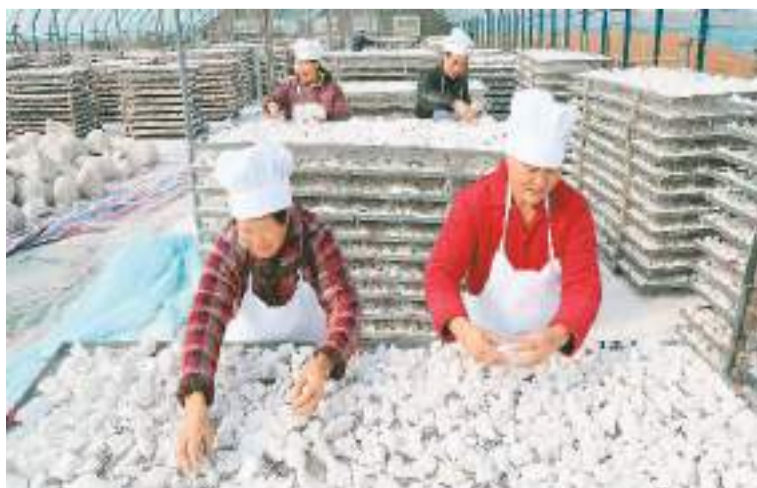
河南洛阳汝阳县是全国优质红薯生产大县，初冬时节，该县红薯粉条加工专业村内埠镇罗洼村农民开始忙起为今冬加工粉条做好准备工作。 图为罗洼村农民在晾晒红薯淀粉。

中国驻菲律宾大使黄溪连表示，希望继续推动中菲在医药卫生领域交流合作，促进中医药与菲律宾传统医药互学互鉴，为增进中菲人民健康福祉、构建人类卫生健康共同体作出贡献。