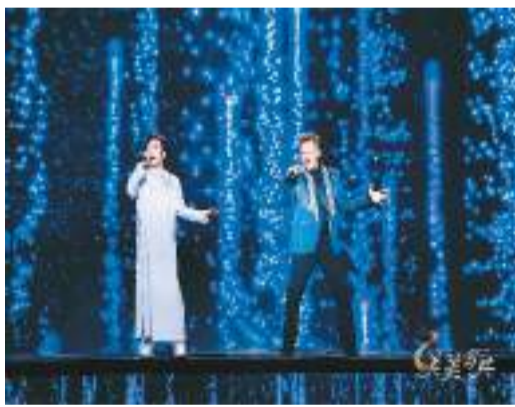
中国歌手李玉刚和俄罗斯歌手维塔斯合作演绎《春江花月夜》与《莫斯科郊外的晚上》。

者作为讲述人，以瓷器、铁路、音乐等意象为线索，还是远赴多国实地拍摄纪录短片，都让节目整体更具真实性，凸显不同文明之间的共同点和相近的价值理念。节目让众多共建“一带一路”国家的故事亲历者、艺术家和文化院团登上舞台，通过讲述、对话与表演，带来多姿多彩的艺术交融盛宴，为推动中华文化“走出去”写下了“和而不同”的生动注脚。