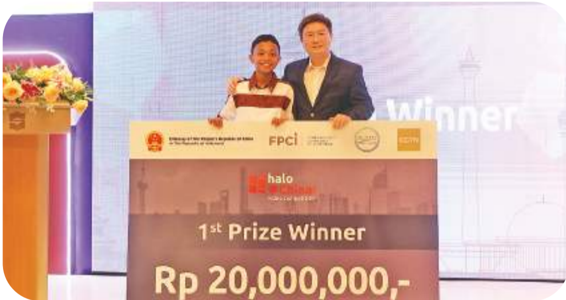
中国驻印尼大使馆公使周侃为一等奖获得者颁奖

中新社雅加达11月14日电(李志全 陈诗梦)第四届“你好,中国!”短视频大赛颁奖仪式14日晚在印尼首都雅加达举行,中国驻印尼大使馆公使周侃、印尼外交政策协会高级研究员索马迪(Soemadi)大使、中国公共外交协会副会长胡正跃、中国外交部前副部长孔铉佑等嘉宾及大赛获奖者出