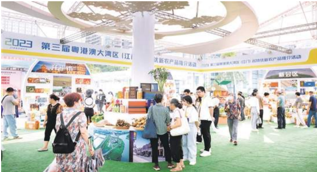
第三屆粵港澳大灣區(江門)名特優新農產品推介活動開幕,琳琅滿目的特色農產品吸引了眾多市民群眾的關注。