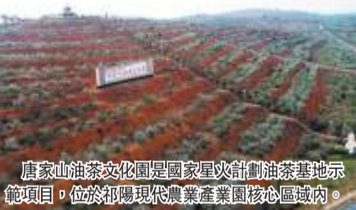
唐家山油茶文化園是國家星火計劃油茶基地示範項目，位於祁陽現代農業產業園核心區域內。