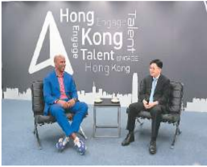
香港特区政府劳工及福利局局长孙玉茜欢迎马布里递交“高端人才通行证计划”申请。

与此同时,香港特区政府正大力建设国际科技创新中心。近年来,特区政府累计在科技创新方面投入近2000亿港元,支持高等院校的科研、香港科学园及数码港的园区发展。目前香港在人工智能、大数据、医疗和生命健康、金融科技等领域发展态势良好。在吸引科