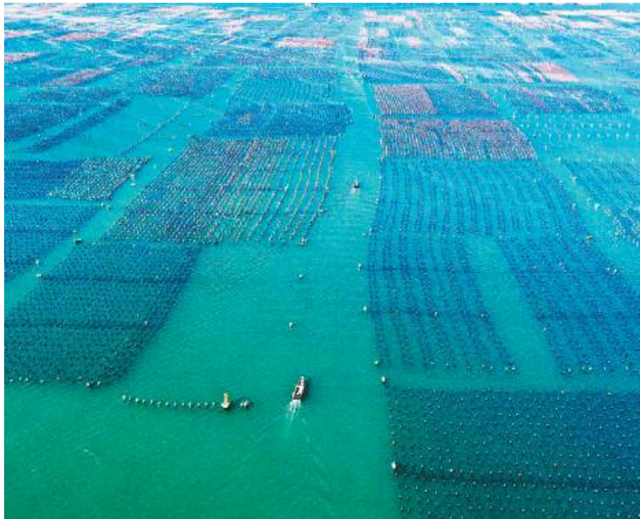
近日,在福建省连江县下宫镇松芦湾海域,养殖户们忙着投喂鲍鱼。近年来,连江县持续优化营商环境,通过科技、产业、财税等多方面措施,进一步做大鲍鱼养殖产业和海洋经济。图为渔民驾驶渔船穿梭在松芦湾海域。

本届总决赛共有840名选手参加,首次将交流活动和比赛穿插进行,比赛以外交流的时间大幅增加。两岸大中小学选手切磋交流球技,结交朋友,领略发展脉搏,增进情感融洽,通过棒球运动交流推动“两岸一家亲”。(据新华社深圳电 记者白瑜、梁希之)