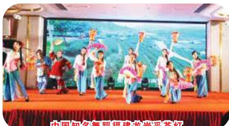
中国知名舞蹈福建龙岩采茶灯