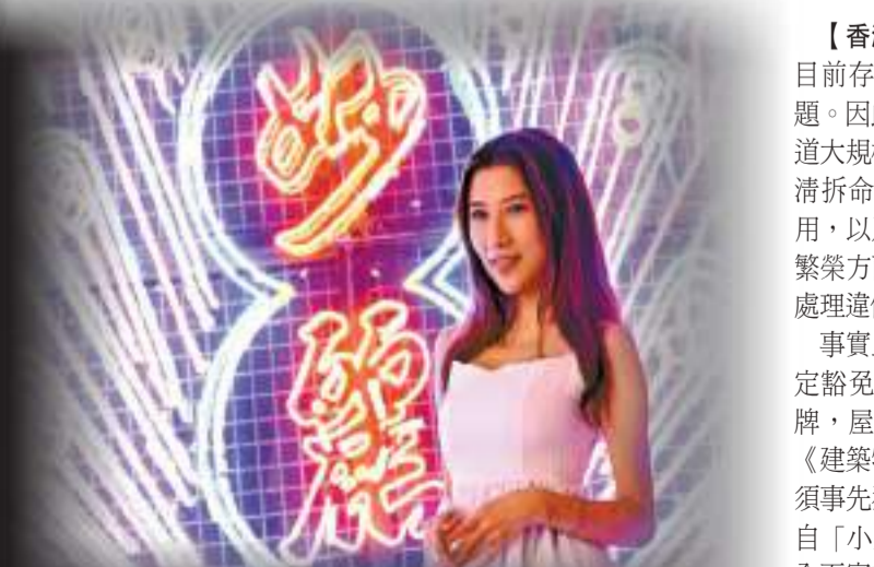
今年6月，香港大館舉辦全新展覽「霓續」，通過標誌性的霓虹燈故事，展示香港獨特而鮮明的視覺文化。

另外，今年6月至9月港島大館亦會進行「霓續」展覽，通過標誌性的霓虹燈故事，展示香港獨特而鮮明的視覺文化形象，當中不少已拆除的霓虹招牌如「東方表行」「大同老餅家」等由霓虹交匯團隊保育下來，重新安裝後再向公眾展示。