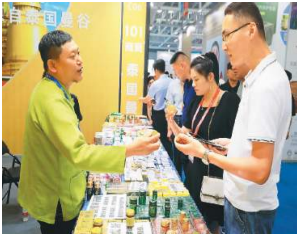
图为在第三届RCEP区域（山东）进口商品博览会上，泰国商户在推销商品。

国际货币基金组织（IMF）近日发布《亚太地区经济展望报告》预测，2023年亚太地区全年经济增长率有望达到4.6%，高于2022年作出的3.9%的增长预期；亚洲开发银行报告显示，中国对亚太地区的经济增长贡献率达64.2%。