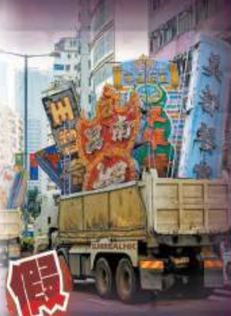
網上流傳一張兩輛正在行駛的貨車裝着十多個霓虹招牌的照片，其實是香港攝影師透過PS創作的作品。