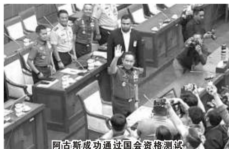
阿古斯成功通过国会资格测试