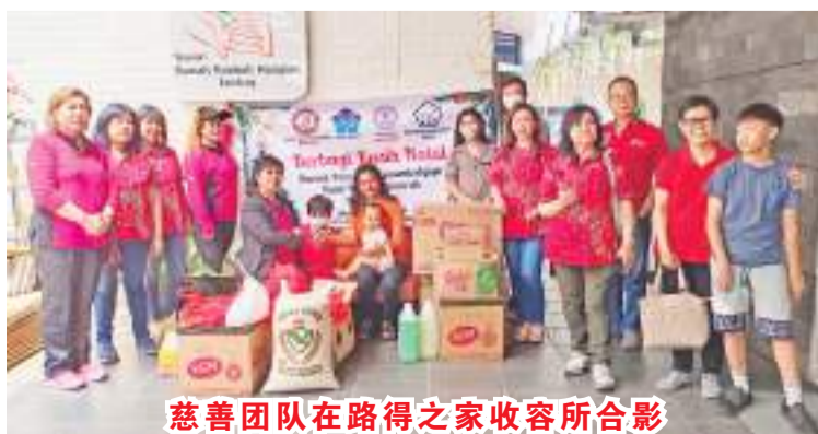
慈善团队在路得之家收容所合影