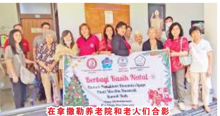
在拿撒勒养老院和老人们合影

第三个地方是Jl. Ciku-tra No 7的拿撒勒养老院(PantSosTresna Wreda Nazareth)。老人们很开心地接受小小礼物和食品。还有老人独唱“甜蜜蜜”和大家同乐。也有老人因思念久违了的家人而潸然泪下，让人深感忧伤。(雪妮报道)