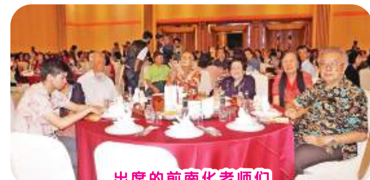
出席的前南化老师们