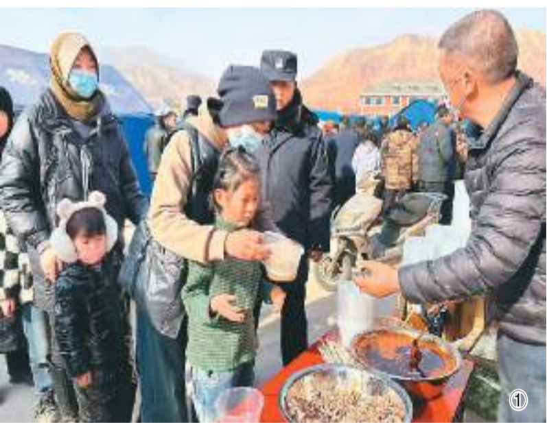
图①:在甘肃省临夏回族自治州积石山县安置点,受灾群众排队取餐。图②:青海省民和回族土族自治县民兵预备役人员为受灾群众运送物资。图③:西部战区第76集团军某旅官兵在甘肃省临夏回族自治州积石山县大河家镇陈家小学展开救援。图④:消防人员在甘肃省临夏回族自治州积石山县大河家镇开展救援。

12月18日23时59分,甘肃省临夏回族自治州积石山发生6.2级地震。地震发生后,有关地区和部门坚决贯彻落实习近平总书记重要指示,争分夺秒、全力以赴,做好抗震救灾各项工作,尽最大努力保障人民群众生命财产安全。目前抗震救灾各项工作正在紧张有序进行,帐篷、折叠床、棉被等救灾物资紧急运抵灾区。