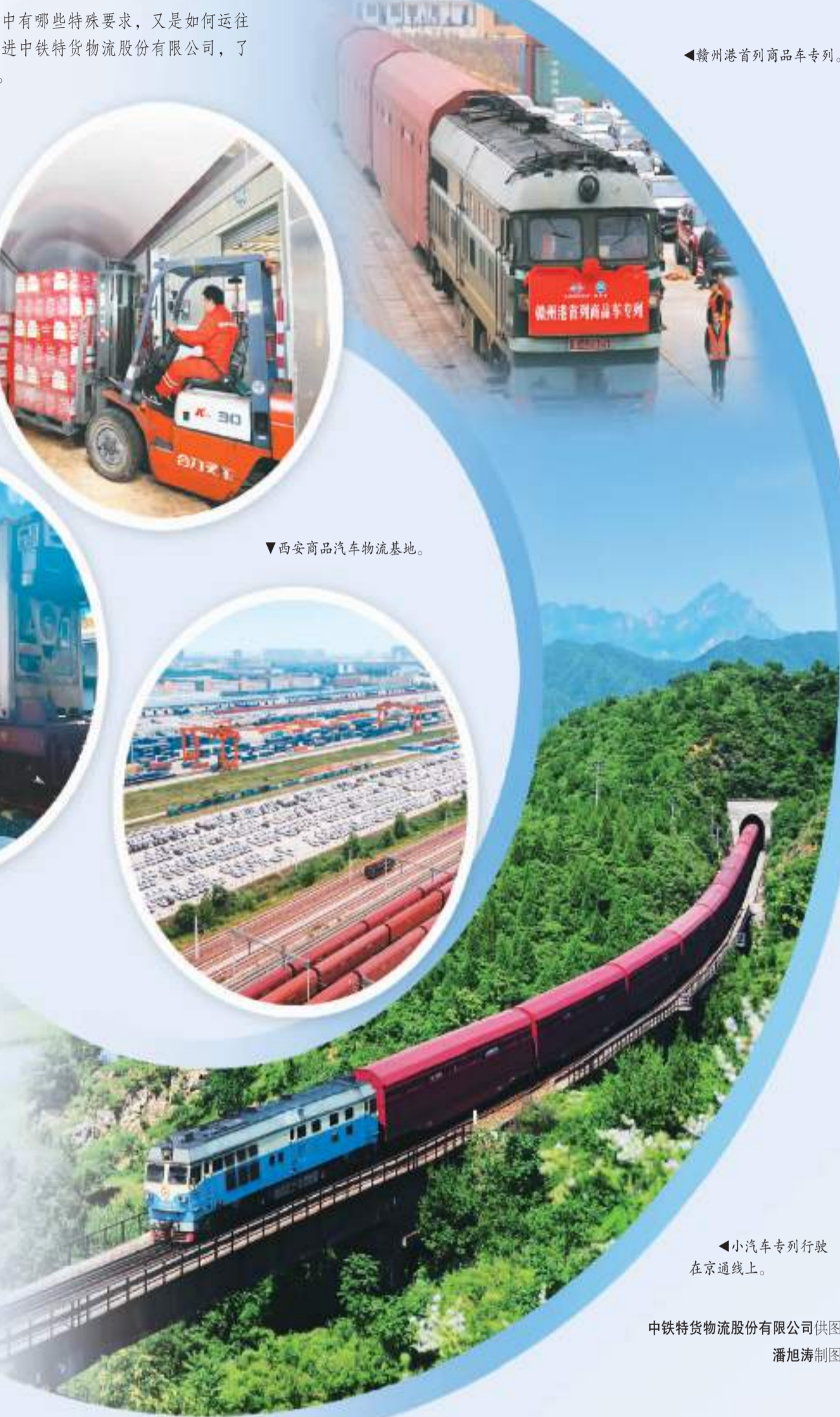
▶赣州港首列商品车专列。