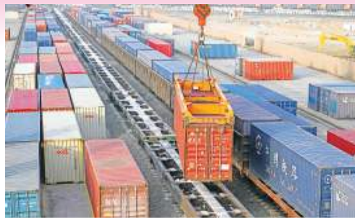
二连浩特:铁路口岸中欧班列稳步增长。12月13日,龙门吊在二连站机械作业区吊装集装箱。二连浩特铁路口岸是中蒙俄经济走廊和中欧班列中线通道上的关键节点。今年以来,二连浩特铁路口岸出入境中欧班列数量稳步增长。截至12月10日,二连浩特铁路口岸接发中欧班列3118列,同比增长32.2%。这也是该铁路口岸自2013年开行首列中欧班列以来,首次在年内突破3000列。

英国《金融时报》报道说，全球矿业企业力拓集团对中国制造业活动持续回升充满信心。力拓集团首席执行官石道成表示，中国基础设施和汽车行业“非常繁荣”，需求强劲，“我们在市场上看到了这一点，我相信这