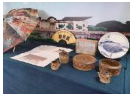
參賽的外國友人對平遠臍橙贊不絕口。

“2023東亞文化之都·中國梅州活動年”閉幕式活動由廣東省文化和旅游廳、梅州市人民政府主辦，梅州市文化廣電旅游局、豐順縣人民政府承辦。