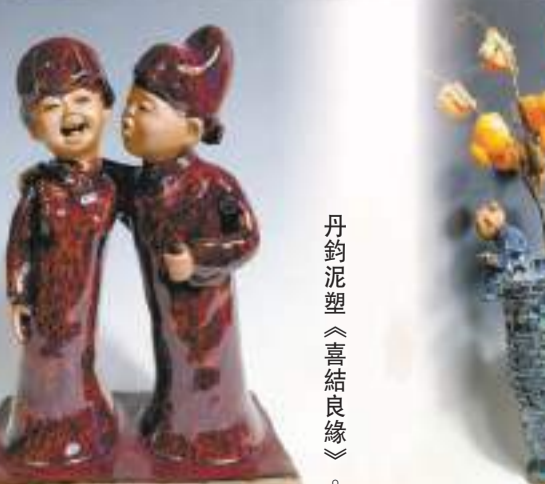
丹鈞泥塑《喜結良緣》。