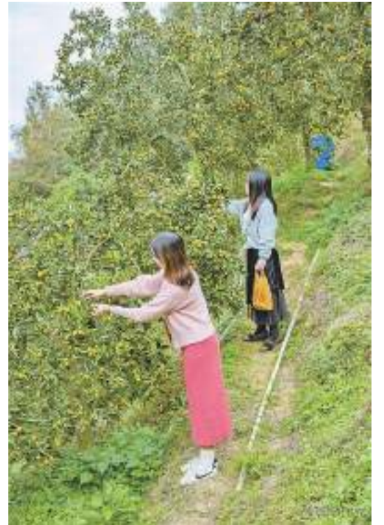
遊客正在採摘金桔。