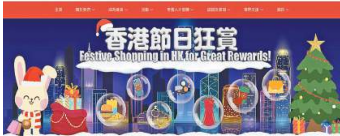
零售管理協會推出「香港節日狂賞」活動，集全港逾3000間零售店舖，在聖誕及農曆新年期間提供消費優惠。

【香港商報訊】記者萬家成報道：今年聖誕及新年活動一籬籬，繽紛樂趣多。零售管理協會從昨日起至明年2月29日推出「香港節日狂賞」活動，集全港多間零售店舖，在聖誕及農曆新年兩大節慶期間，提供各種消費折扣及禮遇，以鼓勵市民留港消費，並吸引遊客節日期間來港購物旅遊。此外，旅發局今日起亦分批派發20萬份「香港夜饗樂」本地市民版餐飲消費券，與眾同樂。