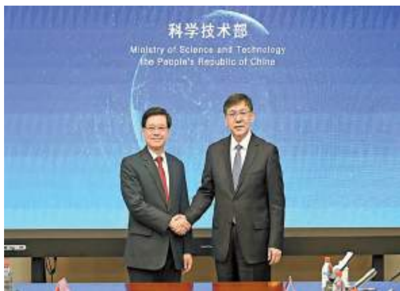
李家超（左）昨日與陰和俊（右）會面。

李家超感謝國家對香港創科發展的支持和信任，在港成立了16所國家重點實驗室。他說，科技部與特區政府今年3月簽署《內地與香港關於加快建設香港國際創新科技中心的安排》，標誌着內地與香港科技合作打開新篇章。他期待與科技部進一步加強內地與香港創科合作，加快建設香港國際創新科技中心，發揮香港「背靠祖