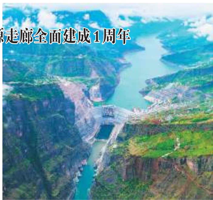
白鹤滩水电站工程全景。

本报昆明12月19日电 (记者张驰) 由长江干流乌东德、白鹤滩、溪洛渡、向家坝、三峡和葛洲坝6座梯级电站共同构成的世界最大清洁能源走廊,于12月20日迎来全面建成1周年。1年来,6座梯级电站累计发电量突破2700亿千瓦时,可节约标准煤超8100万吨,减少二氧化碳排放超2.2亿吨,满足2.8亿人1年的用电需求。除清洁能源保供外,这条走廊还形成768公里的深水库区航道,及总库容919亿立方米的梯级水库群和战略性淡水资源库,持续实现航运、抗旱补水、生态调度等综合效益。目前,长江干流梯级水库已全部蓄水到位。