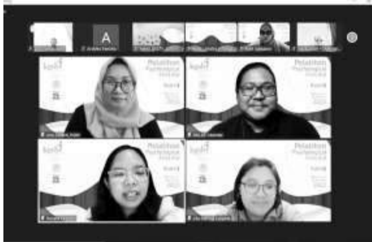
青少年心理健康问题成为专家们讨论焦点。

【本报讯】在过去11年间,即2012年-2023年,我国记录了2112例自杀案例,其中985例或占46.63%为青少年。在全球范围内,世卫组织(WHO)于2019年发布的数据显示,全球的自杀案例中,15-29岁青少年年龄组为第四大死因。我国青少年心理健康调查于2022年进行了一项更深入的调查,其结果令人震惊。在过去12个月的所有调查样本中,1.4%的青少年承认有自杀意念,0.5%的人有自杀计划,0.2%的人试图自杀。究竟是什么因素导致青少年自杀率居高不下呢?心理健康问题是主要原因。同一项调查显示,每20名青少