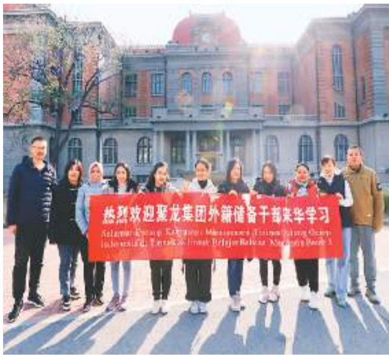
聚龙集团学员们在来华培训期间合影留念。

2020年以来累计组织“汉语桥”相关线上线下团组63个、国际中文教师奖学金团组23个，吸引了众多海外中文学习者参与——这是天津外国语大学开展国际中文教育相关活动的数据。在这些数据背后，是更多的人走近中国、爱上中国。