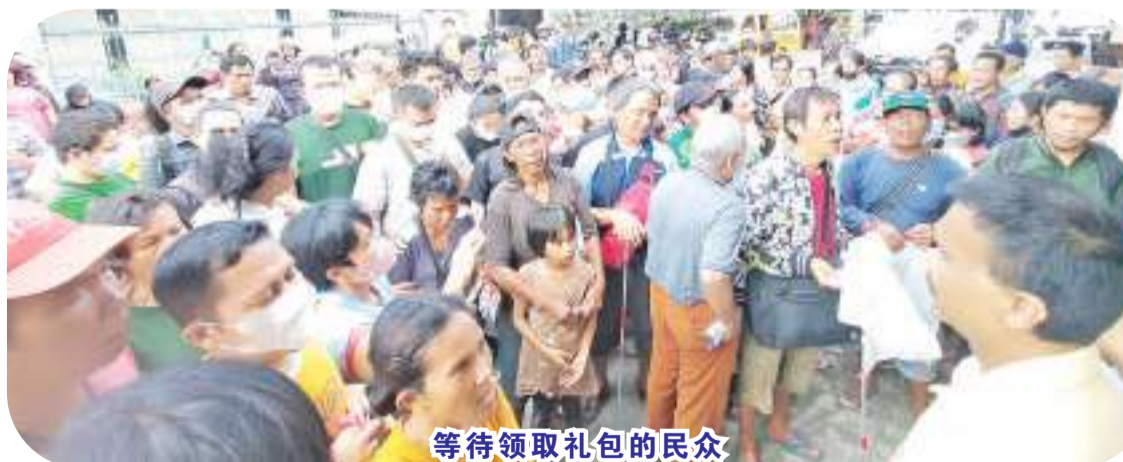
等待领取礼包的民众

日里棉兰扶轮社和捐助者为活动的开展提供了道义、精力和物质援助。如果没有捐助者的帮助，基金会就做不了多少事情。在分发前，受惠者背诵祈祷文和诗歌，他们希望基金会和伸出援手捐助者能够得到全能神的丰盛祝福和健康。(国强报导)