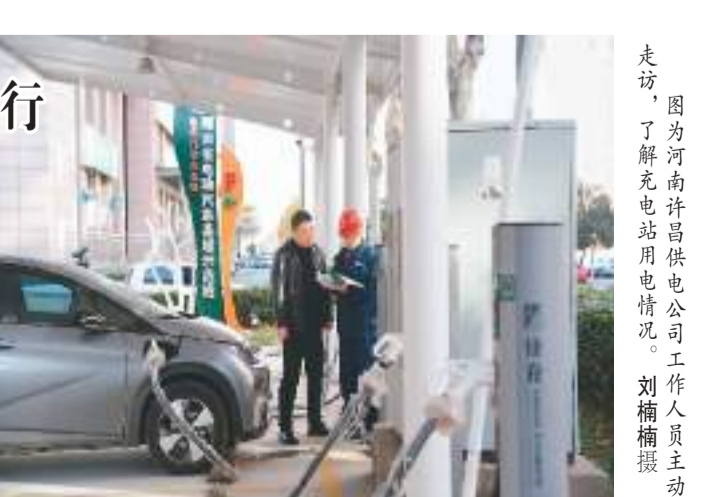
走访，图了解许昌供电公司工作人员主动

本报许昌12月19日电（俞晓）河南许昌供电公司工作人员19日来到位于该市泰山路电动汽车示范街区集中式公用充电站，了解充电站投入使用后的用电情况，征求用电意见。该充电站是许昌今年2000个公共领域充电基础设施项目之一，可满足40台以上新能源汽车快速充电。