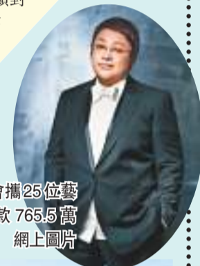
韓紅基金會籌25位藝人為災區捐款765.5萬元。