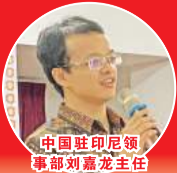
中国驻印尼领事部刘嘉龙主任