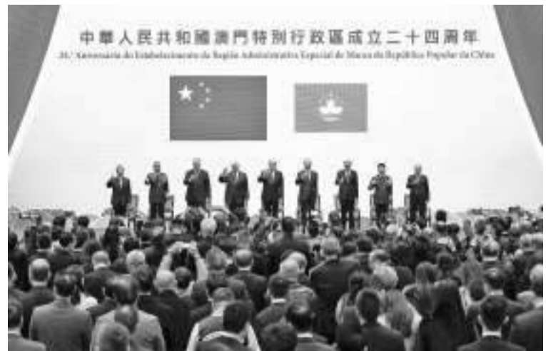
12月20日,澳门特区政府举行酒会,庆祝澳门回归祖国24周年。

全国政协副主席何厚铨、澳门中联办主任郑新聪、澳门特区政府前行政长官崔世安、外交部驻澳特派员公署特派员刘显法、解放军驻澳门部队司令员于长江、政