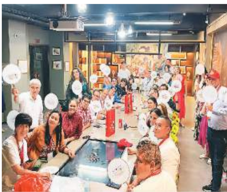
“汉语桥”哥伦比亚教育工作者访华团组到天津杨柳青古镇体验年画制作。

“在中国的每一天都有新的体验和收获。”这是印尼学员的感受。通过为期8个月的语言文化和管理专业研修，他们的工作能力有了长足的进步，汉语水平也有了质的飞跃，汉语水平考试（HSK）三级通过率百分百。