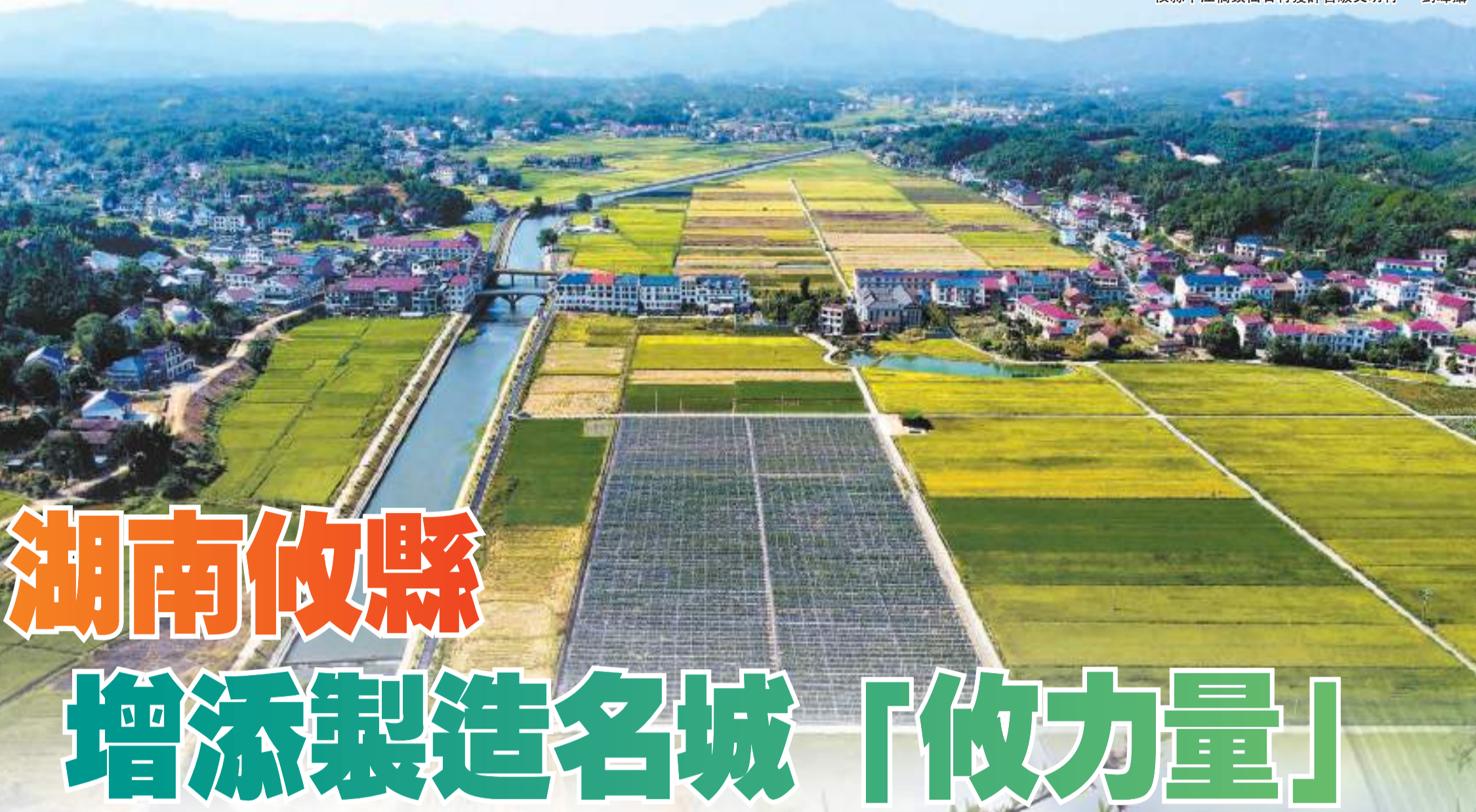
攸縣江橋鎮仙石村獲評省級文明村。