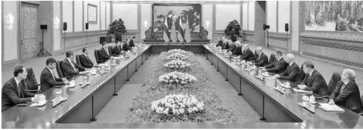
12月20日上午,中国国家主席习近平在北京人民大会堂会见俄罗斯总理米舒斯京。新华社记者 丁林 摄

习近平指出,今年以来,我同普京总统两次会晤,两国政府、立法机构、政党、地方开展密切交往,各领域务实合作健康稳定发展。今年前11个月,中俄双边贸易提前实现了我同普京总统共同制定的年贸易额2000亿美元目标,展现出两国互利合作的强大韧性和广阔前景。维护好、发展好中俄关系,是双方基于两国人民根本利益作出的战略选择。中方支持俄罗斯人民走自主选择的发展道路。中方愿同俄方以明年中俄建交75周年为新起点,不断放大两国高水平政治关系的积极效应,在全面推进各自经济社会发展、实现民族复兴的进程中继续携手前行。