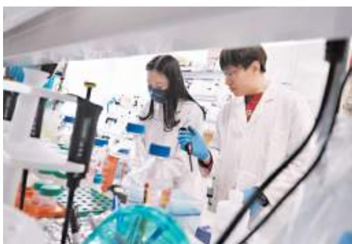
◆新計劃硬性要求投資者最少300萬元投資創科行業。圖為香港創科重點項目之一的生物醫藥科技實驗室。資料圖片

香港曾在2003年實施「資本投資者入境計劃」，最初投資門檻為650萬元，2010年提升至1,000萬元，同時將買樓別出資產類別選項。該計劃在2015年停辦。回顧2003年至2015年的12年內，「資本投資者入境計劃」共錄得35,262宗獲批個案，即平均每年約3,000宗。資料顯示，截至2014年底，「資本投資者入境計劃」共吸引資金2,160億元。