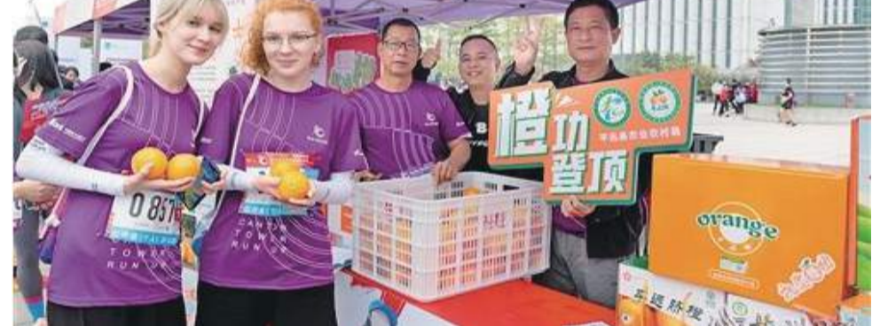
參賽的外國友人對平遠臍橙贊不絕口。

名錄、廣東省優質柑桔金獎等一系列“金名片”。據統計，今年平遠臍橙種植面積5.45萬畝，預計鮮果產量5.9萬噸，實現綜合總產值超11億元，產業受益人數達1.4萬人，平遠臍橙已成為名副其實的“黃金果”“致富果”。時下正是平遠臍橙豐收採摘的時節，平遠縣熱誠邀請各地友人到平遠“賞茶花、拜大佛、品臍橙、游五指、泡溫泉”。