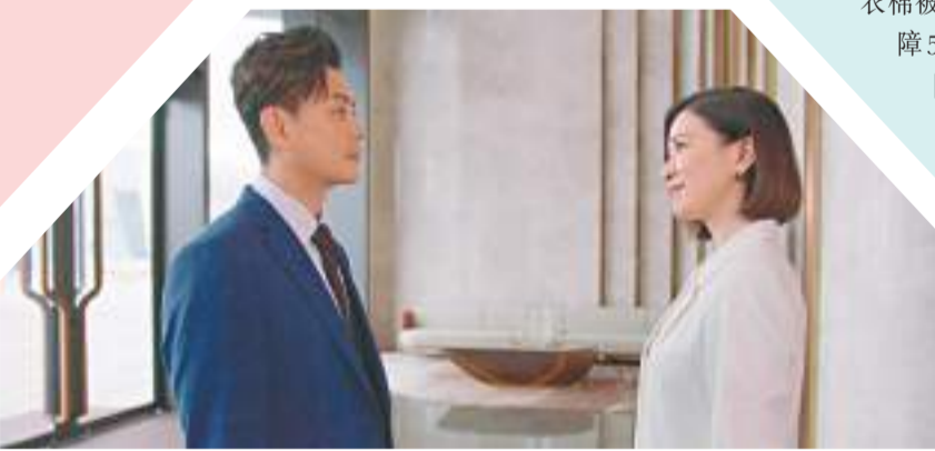
黃宗澤驚喜亮相大結局掀熱話。