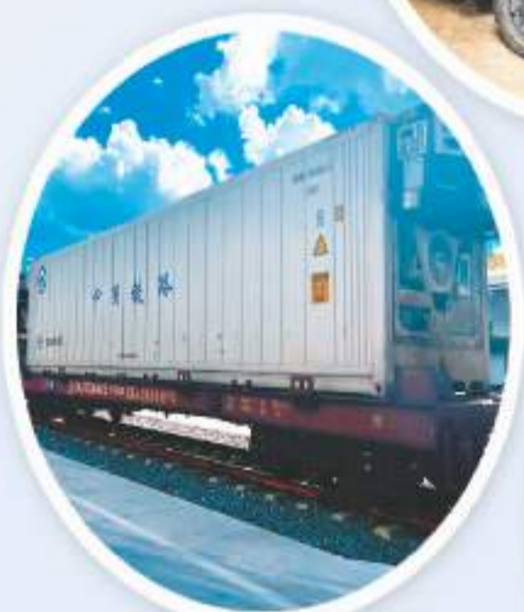
▼中老铁路冷藏集装箱。