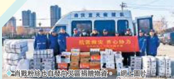
肖戰粉絲也自發向災區捐贈物資。