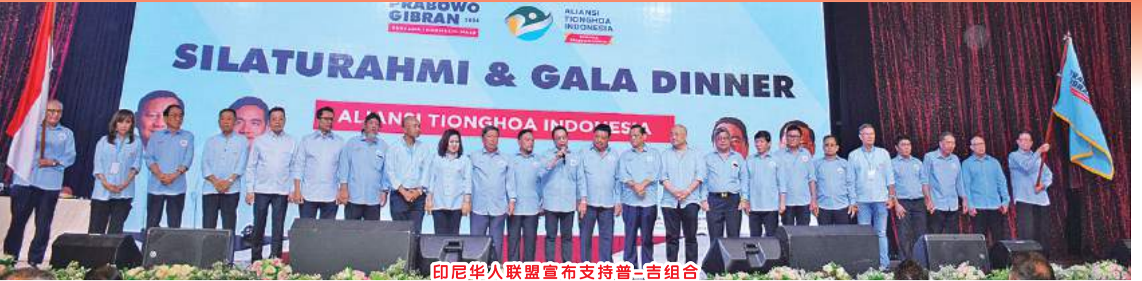
印尼华人联盟宣布支持普-吉组合

【本报讯】2023年12月19日周二晚，印尼华人联盟(Sindo)在雅加达芒果杜瓦广场大厦 Golden Sense 餐厅举办与普-吉(Prabowo Gibran)组合进行聚会和晚宴，场面热闹非凡。