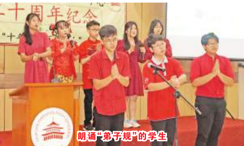
朗诵“弟子规”的学生