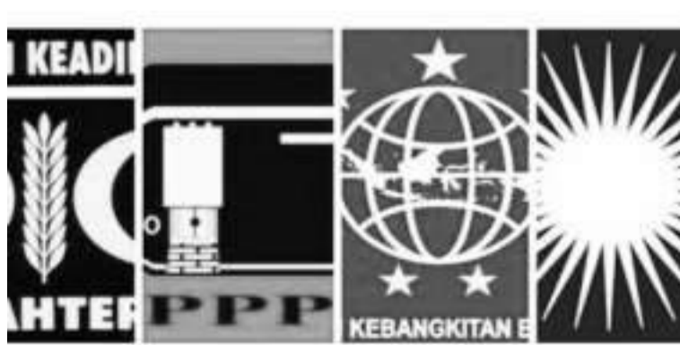
伊斯兰教政党势力逐渐壮大。

增强了这对候选人作为伊斯兰教政党的选举能力。总统候选人甘贾尔-马福获得了议会政党团结建设党的支持。二号总统候选人普拉波沃-吉布兰缺乏强大的投票基础,两人与伊斯兰教人物的关系不太密切。该联盟虽然得到了星月党的支持,但是该党并未获得议会席位。从上述结果来看,伊斯兰教政党在2004年选举中获得了大量选民,但是在2009年选举中有所下降。根据记录,2004年大选是我国首次进行总统直选,因此总统的作用很大,候选人那里影响选民的票数。在三个伊斯兰教政党中,公正福利党成为选票最稳定的政党,而且在2019年选举中大幅跃升。公正福利党被誉为拥有忠诚干部的政党,这是可以理解的。据了解,几年前有人谈论伊斯兰教政党联合起来形成新的轴心的构思。根据2019