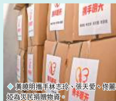
黃曉明攜手林志玲、張天愛、佟麗婭為災民捐贈物資。

王源向甘肅災區捐贈100萬元，源基金會第一時間也捐贈了40萬元和防寒應急物資；時代少年團向甘肅災區捐款100萬元；張藝興以粉絲的名義捐贈50萬元；劉宇寧、戚薇、劉濤、成毅分別以個人名義向災區捐款50萬元；孟子義、張大大分別捐款20萬元；曾舜晞以個人名義捐1,000套防寒衣物，又和工作室一起捐1,000套防寒衣物，與災區人民攜手共渡難關。