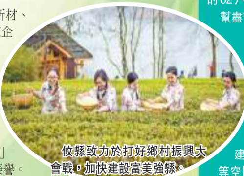
攸縣致力於打好鄉村振興大會戰，加快建設富美強縣。

目前，攸縣創建科技示範基地和示範園22個。縣科技專家服務團以22個科技示範基地和示範園為技術服務對象，推動企業從傳統農業向新興產業延伸，跨界拓展。攸縣科技型中小企業認定158家，高新技術企業43家，成功申報省企業技術中心5家。今年前三季度，製造業增加值佔GDP比重20.4%。今年，安特新材、地博光電等2家企業獲評國家級專精特新「小巨人」，宏信科技、亞美茶油分別獲第五屆「中國造隱形冠軍」「時代匠人」榮譽。