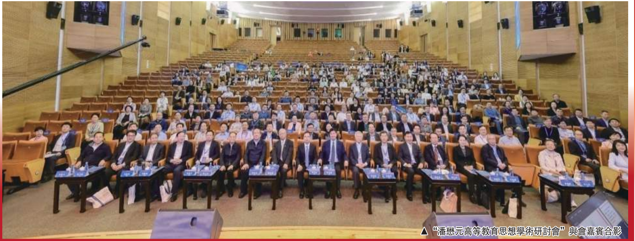
▲“潘懋元高等教育思想學術研討會”與會嘉賓合影

研究中心、廈門大學教育研究院、廈門南洋職業學院、福建省高等教育研究院、廈門大學習近平教育論述研究中心聯合主辦“潘懋元高等教育思想學術研討會”系列活動，以各種形式緬懷和追憶潘懋元先生。