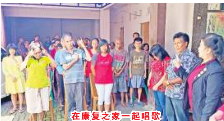
在康复之家一起唱歌