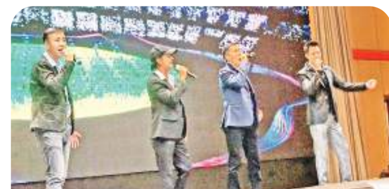
四大英雄歌唱组合献唱风采