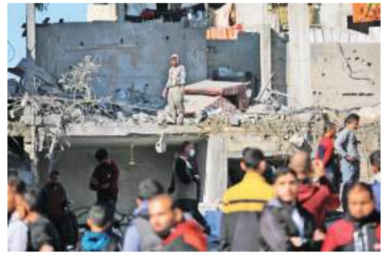
12月19日，在加沙地带南部城市拉法，人们查看以军空袭后的建筑废墟。

成立了包括主要反对党领导人、前国防部长本雅明·甘茨在内的紧急联合政府。而甘茨日前在会见被扣押人员家属时表示，如果政府不优先考虑解救被扣押人员、通过谈判达成新一轮停火协议，他将不会留在战时内阁。媒体分析指出，内塔尼亚胡执意推进军事行动，很大程度是因受到执政联盟内部极右翼势力影响。据《以色列时报》报道，极右翼政党领导人、国家安全部长伊塔马尔·本-格维尔威胁道，如果政府不能“全力以赴”推进军事行动，他将退出执政联盟。这意味着内塔尼亚胡政府将走向垮台。