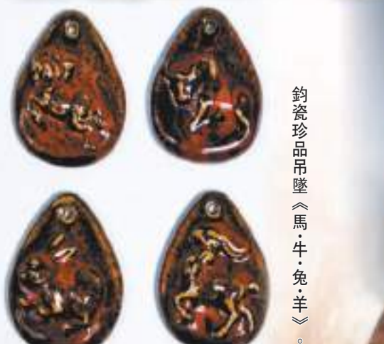
鈞瓷珍品吊墜《馬·牛·兔·羊》。