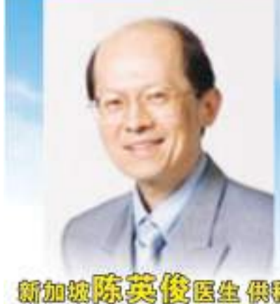
新加坡陈英俊医生供稿