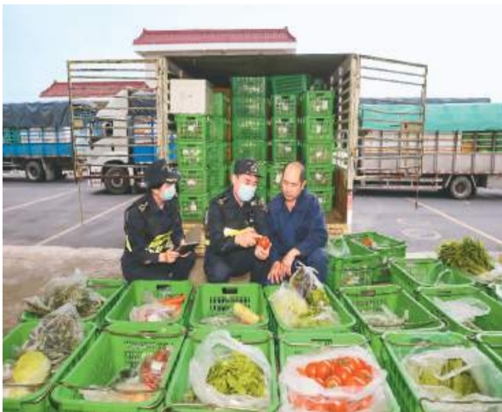
本报珠海12月19日电（贺林平、聂麟惠）12月20日是澳门回归祖国24周年纪念日。据统计，24年以来，内地对澳门累计进出口总值4421亿元人民币；其中，经拱北海关对澳门地区进出口总值累计达3568亿元，在同期内地对澳门地区进出口总值中的占比超八成。

今年以来，内地对澳门地区进出口继续呈平稳向好势头，1—11月经拱北海关进出口达200.6亿元。其中，以一般贸易方式进出口162.1亿元，同比增长15.2%，占比超80%，较1999年提升超40个百分点。此外，内地供澳民生物资出口快速增长。据拱北海关统计，今年前11个月，内地经该关向澳门地区出口电力、农产品、医药材及药品、天然气等民生物资分别为32.4亿元、31.7亿元、4.9亿元、3.7亿元，合计占36.8%，在保障澳门民生需求方面的作用持续发挥。