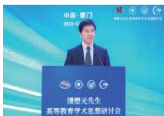
▲中國高等教育學會會長、教育部原黨組副書記、副部長杜玉波講話

中國高等教育學會會長、教育部原黨組副書記、副部長杜玉波發表講話，高度讚揚了潘懋元先生的教育家精神。他說，潘先生一生立德立功立言，具有心有大我、至誠報國的理想信念，言為士則、行為世範的道德情操，啟智潤心、因材施教的育人智慧，勤學篤行、求是創新的躬耕態度，樂教愛生、甘於奉獻的仁愛之心和胸懷天下、以文化人的弘道追求，堪稱為師、為學的楷模。潘先生早在1979年就提出組建全國高等教育學會的設想，為學會的建立和發展做出了巨大貢獻。今天我們研究潘懋元先生的高等教育思想，目的是廣續教育家精神，加快建設教育強國，為中華民族偉大復興貢獻智慧和力量。