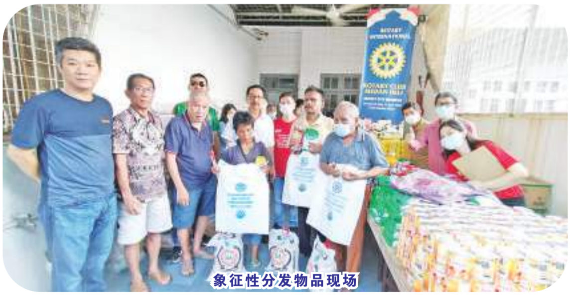
象征性分发物品现场

【本报讯】2023年12月16日(周六)下午2时，日里棉兰扶轮社基金会于冷沙街其办事处向贫困家庭基督徒及盲眼民众，分发230配套圣诞节和新年爱心礼包，计有白米、牛奶膏、砂糖、酱油、煎油、饼干、米粉、衣服等。