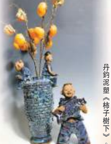
丹鈞泥塑《柿子樹下》。