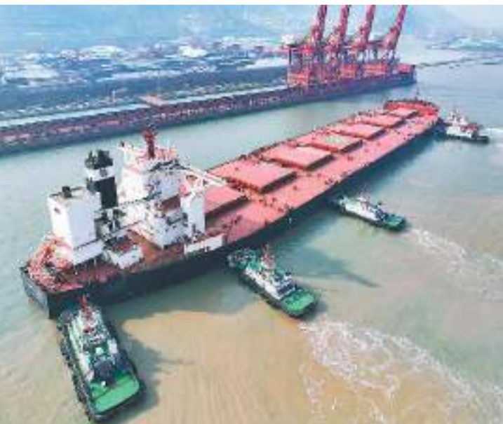
12月19日，满载约40万吨铁矿石的“巴西矿石”号顺利靠泊江苏首个40万吨级矿石码头连云港88号泊位，标志着连云港正式具备40万吨超大型散货船靠泊接卸能力。据悉，这艘“巨无霸”船长362米，进港吃水深度达22.9米，船上所载的铁矿石将全部在连云港港口完成卸载，并通过海铁联运等方式运往长三角以及陇海铁路沿线地区。

朱凤莲表示，最近一段时间，我们不断接到台湾民众、各界人士反映，他们来大陆进行正常的交流、参访，经常遭到民进党当局相关机构的盘问、恐吓和阻挠，有些人甚至被罗织莫须有的罪名遭到侦办。两岸人员往来和各领域交流已经开展了30多年，民进党当局制造的这种寒气逼人的肃杀氛围，让广大台湾民众强烈不满，纷纷质疑民进党使台湾回到了从前的“戒严”时期。