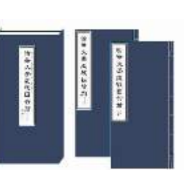
图为发布的《清华大学藏战国竹简（拾叁）》。

此次刊布的两篇音乐类文献，内容也十分重要。《五音图》中央绘有一五角星，其上角对应宫组音名，其他四角对应商、角、徵、羽各组，按逆时针方向依次分布。五角星图形由“宫一徵”“徵一商”“商一羽”“羽一角”“角一宫”5条连线构成，展示了五音生成的规律，其背后蕴含的思想是“三分损益法”，与《管子》《淮南子》等书记载的五音生成顺序相合。《乐风》分两部分，前一部分记载音律名