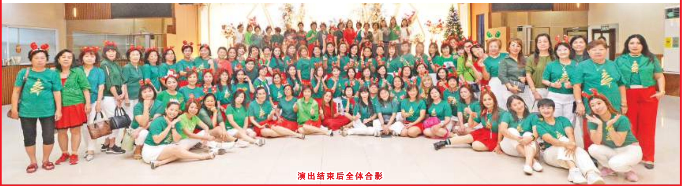
演出结束后全体合影