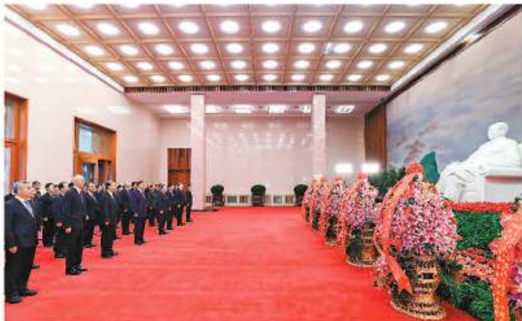
12月26日，中共中央在北京人民大會堂舉行紀念毛澤東同志誕辰130周年座談會。唐樂蔭、李強、趙樂際、王麗華、蔡奇、丁薛祥、李希、韓正等領導同志到毛主席紀念堂瞻仰毛澤東同志遺容。