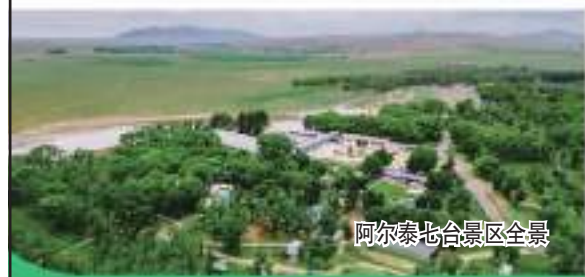
阿尔泰山景区全景