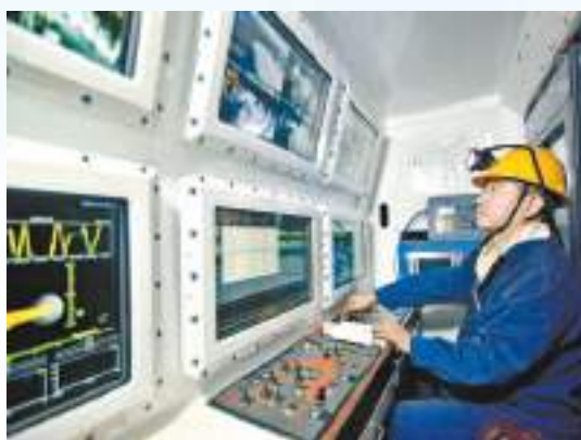
位於800米井下的十礦集中控制中心

全力推進綠色減排。形成「高濃度瓦斯壓縮——中濃度瓦斯提純——低濃度瓦斯發電——超低濃度瓦斯氧化」+餘熱利用的瓦斯梯級綜合利用新模式，在河南省率先實現煤層氣商業化利用，力爭「十四五」末全面建成近零排放礦井，「十五五」末之前實現礦井瓦斯綜合利用率均達到90%以上，全面建成淨零排放礦井，加快公司綠色低碳轉型發展。 布局30萬噸精煤液化項目。超前布局新興煤化工高端產業，利用公司特有1/3焦煤資源經加氫等工藝進行液化，生產性能突出的包圍覆青等優質碳材料，轉換發展賽道，加快轉型升級，高質量建設現代化平煤股份。