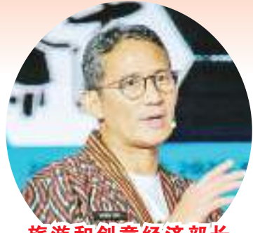
旅游和创意经济部长 善迪亚卡