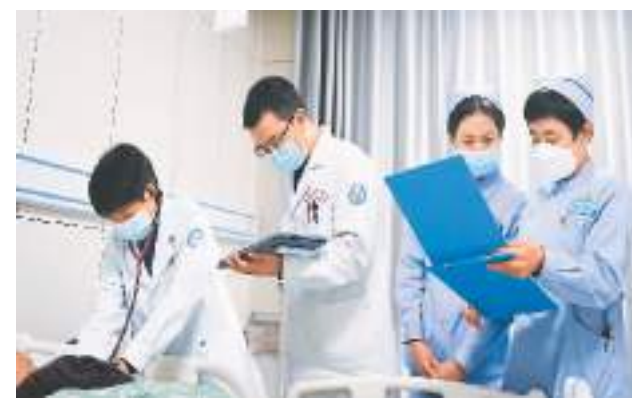
近年来，青海省海东市化隆回族自治县组建紧密型“医共体”，推动“基层首诊、双向转诊、急慢分治、上下联动”的分级诊疗体系建设，提升基层医疗服务能力。图为11月30日，该县人民医院医生通过移动设备查询患者信息。

更多医务人员走进基层，帮助群众解决最突出的健康问题，将健康知识、健康理念融入群众生活。