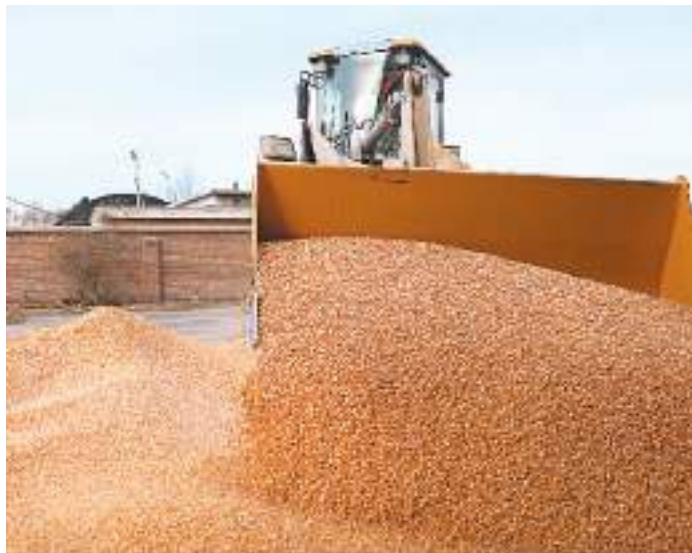
工人驾驶铲车在辽宁省台安县桓洞镇的一家粮库内卸载玉米。

这一年，国家继续提高早稻和小麦最低收购价，增加产粮大县奖励资金，出台支持大豆生产等政策组合拳，有效调动农民种植积极性。全国粮食播种面积17.85亿亩，比上年增加954.6万亩。 这一年，主要农作物大面积单产提升行动启动，在100个大豆、200个玉米重点县整建制推进。全年粮食平均亩产389.7公斤、提高2.9公斤，单产提高对增产的贡献达到58.7%。 中国粮食生产再丰收，为全面推进乡村振兴、加快建设农业强国奠定了坚实基础，也为稳定全球粮食市场、维护世界粮食安全作出了积极贡献。