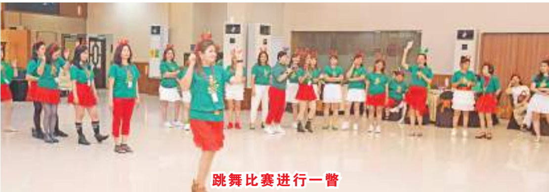
跳舞比赛进行一瞥