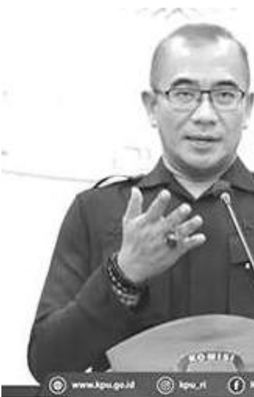
普选委员会主席哈欣 (Hasyim Asy'ri)。

【本报讯】普选委员会表示，之前，普选委驻台北市代表将62,552张选票过早地发送给台北市的31,276名我国选民，当被视为废票。其实，普选委2023年第25号条例规定，2024年大选选票应该是由当地的海外普选委于2024年1月2日至11日邮寄给登记的海外选民。