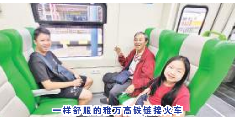
一样舒服的雅万高铁链接火车

学校放假，年轻父母亲还工作，如何安排儿女假期，万隆王氏姐妹协商后，决定试乘雅万高铁由万隆到雅加达来回雅加达摩登大超市，见证疫情后各超市热闹情况。她们先和血液专科内科医生商量后，也陪同8、9月进出医院输血，输血