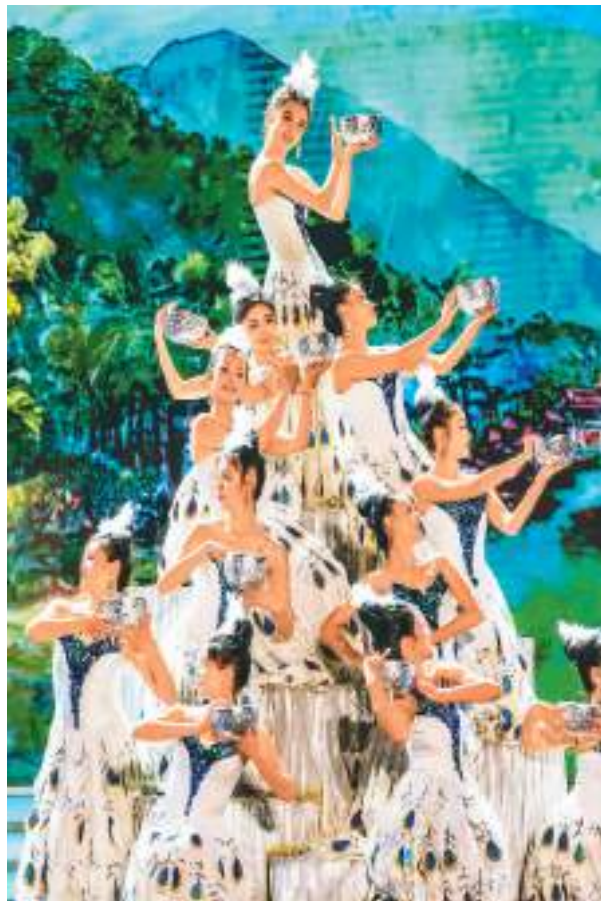
近日，第十一届澜沧江—湄公河流域国家文化艺术节开幕式暨文艺晚会在云南省西双版纳傣族自治州景洪市举行。图为中国艺术工作者在表演舞蹈《美丽的传说》。

澜湄民心相知相通。各方持续加大教育、文化、妇女、减贫、体育等民生领域投入，人文交流合作越发丰富多彩。日前，第十一届澜沧江—湄公河流域国家文化艺术节在云南省西双版纳傣族自治州景洪市举行，六国艺术工作者通过音乐、舞蹈、摄影、绘画等艺术形式展示本国文化特色。澜湄地区文明交流互鉴不断深化，构筑起民心相通新桥梁。