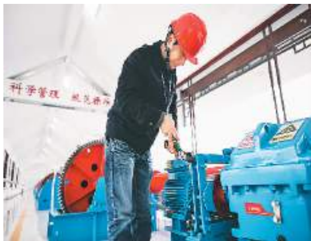
左图：洪泽古灌区至今仍发挥着重要的作用。因为工作人员在三河闸检查启闭机。

“清华简”于2008年入藏清华大学。整理报告目前已顺利出版13辑。清华大学出土文献研究与保护中心表示，“清华简”整理已进入攻坚阶段，整理团队将克服困难，保证每年一册的出版进度，早日将这批重要材料向社会与学界公布。