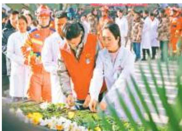
甘肅舉行哀悼積石山6.2級地震遇難同胞哀悼儀式。中新社