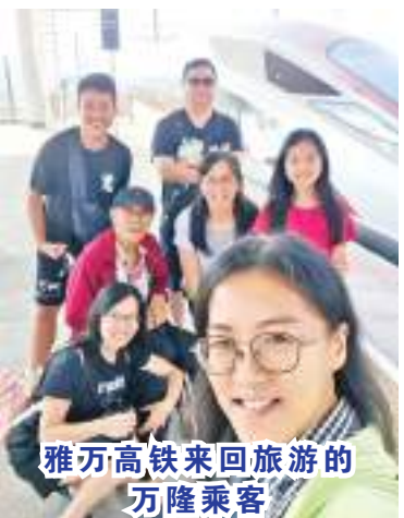
雅万高铁来回旅游的万隆旅客