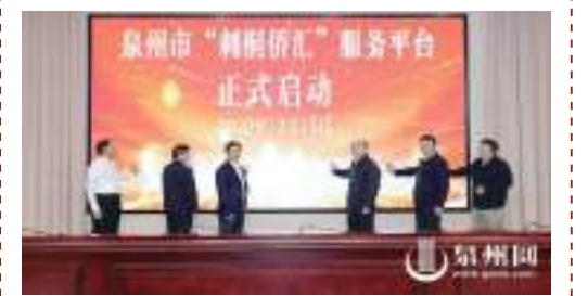
啓動儀式現場

“刺桐僑匯”服務平臺依托“閩政通”App,依靠在“泉服務”板塊。據悉,我市已打通部門之間的服務網絡,融合市僑辦、市外匯局、市金融監管局、市公安局、市僑聯等工作職能,在市數字辦的指導下,實現多部門、多領域的場景應用,打造數字化、智能化、可分析、可監督的服務平臺,使廣大海外僑胞充分享受便利。