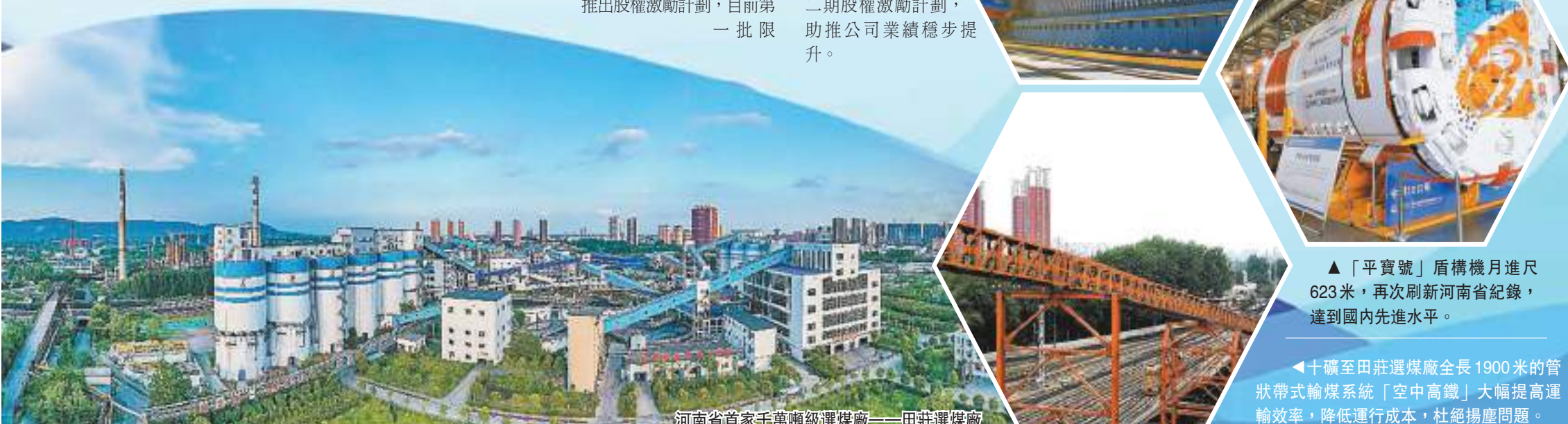
河南省首家千萬噸級選煤廠——田莊選煤廠