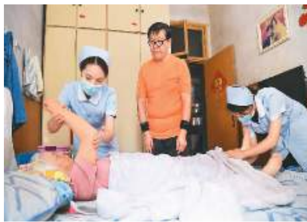
江西省宜春市人民医院启动“互联网+护理服务”新模式，将医疗服务从医院、病房延伸到群众家中，有效满足了行动不便、高龄或失能老人等居家护理需求。图为该院网约护士上门为老年患者提供居家护理服务。 周 亮摄（人民视觉）

公立医院是我国医疗体系的主体。推动公立医院改革和高质量发展，最终目标还是要解决群众反映的看病就医的急