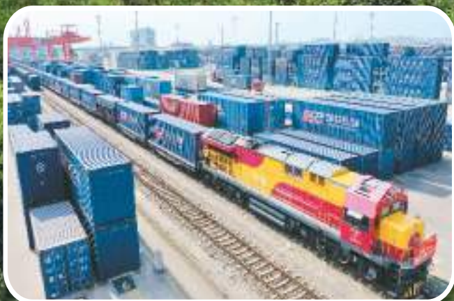
繁忙的成都国际铁路港。