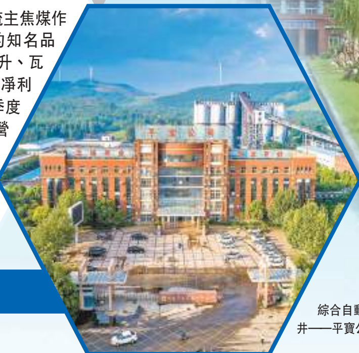
綜合自動化全國領先的智能礦井——平實公司

作面，累計優化用工4000餘人，智能化採煤工作面人均工效平均提高20%以上，智能化掘進工作面人均工效平均提高30%以上，煤礦生產效率提高15%以上，採掘一線作業環境持續改善，職工勞動強度大幅降低，礦井安全保障能力明顯提升。 充填開採，綠色集約。公司在十一礦等礦井實施特厚煤層充填開採新技術，創出國內煤礦充填開採領域充填管路最長（7600米）、充填管徑最大（Φ299毫米）、採高最高（6米）、埋深最深（1021米）、採長最長（261米）、地質條件最複雜（三軟煤層、IV、V類複合頂板）「六項紀錄」，隨着該技術的推廣應用，公司可解放礦區淺部壓覆的優質煤炭資源8億噸，對解決地面矸石堆污染問題，保證產能穩定、緩解接替緊張局面，實現綠色開採意義重大。 數字化運營，共享提速。積極推進數字化建設，建立經營管控大數據分析平台，「人財物」數據流全線打通，「產供銷」信息流一體共享，實現財務管理、人力資源、供應鏈、合同管理、OA等上網作業，有效提高了工作效率，規範了管理流程，降低了企業運營成本，以高水平數字化治理助力企業高效率運行、高效益經營，為高質量現代化公司建設