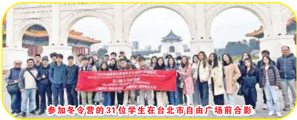
参加冬令营的31位学生在台北市自由广场前合影