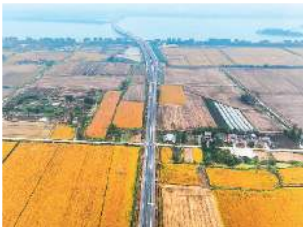
右图：淮安市洪泽区岔河镇境内白马湖畔的农田。