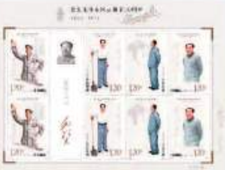
中國郵政於12月26日發行《紀念毛澤東同志誕辰130周年》紀念郵票1套4枚，郵票圖案名稱分別為堅持抗戰、建設十三陵水庫、胸懷天下、重上井冈山。

《紀念毛澤東同志誕辰130周年》紀念郵票一套四枚，郵票圖案名稱分別為堅持抗戰、建設十三陵水庫、胸懷天下、重上井冈山。該套郵票由當代著名油畫藝術家靳尚誼指導，畫家馬剛、靳軍設計，北京郵票廠有限公司採用影寫工藝印製。郵票圖案運用數字繪畫實現傳統繪畫的視覺表現，展現了開國領袖毛澤東的偉人風範、氣質風采，全套郵票面值4.80元，郵票計劃發行數量為780萬套，版式二計劃發行量為98萬版。