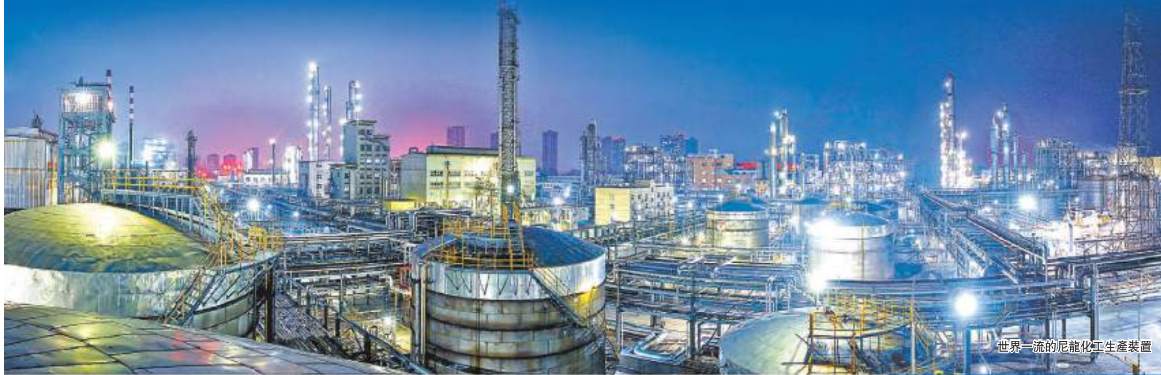
世界一流的尼龍化工生產裝置