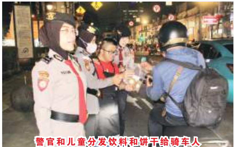
警官和儿童分发饮料和饼干给骑车人