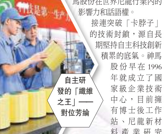
自主研發的「纖維之王」——對位芳綸