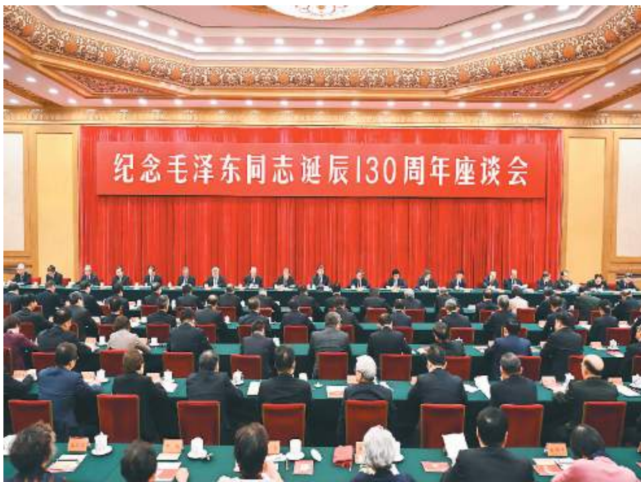
12月26日,中共中央在北京人民大会堂举行纪念毛泽东同志诞辰130周年座谈会。习近平、李强、赵乐际、王沪宁、蔡奇、丁薛祥、李希、韩正等出席座谈会。

■毛泽东同志是伟大的马克思主义者,伟大的无产阶级革命家、战略家、理论家,是马克思主义中国化的伟大开拓者、中国社会主义现代化建设事业的伟大奠基者,是近代以来中国伟大的爱国者和民族英雄,是党的第一代中央领导集体的核心,是领导中国人民彻底改变自己命运和国家面貌的一代伟人,是为世界被压迫民族的解放和人类进步事业作出重大贡献的伟大国际主义者。毛泽东思想是我们党的宝贵精神财富,将长期指导我们的行动。对毛泽东同志的最好纪念,就是把他开创的事业继续推向前进