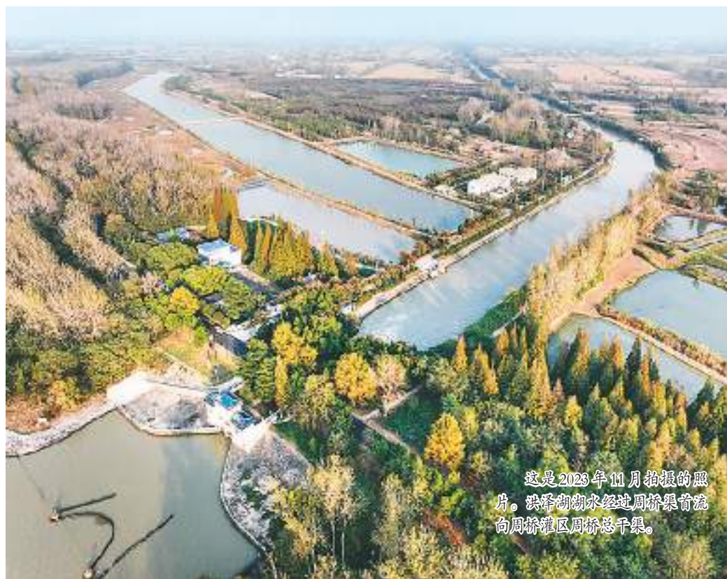
这是2023年11月拍摄的照片。洪泽湖水经过周桥闸枢纽向周桥灌区周桥总干渠。

洪泽古灌区位于江苏省淮安市洪泽区境内，地处中国洪泽湖东侧。灌区西依洪泽湖大堤，东至白马湖，北临苏北灌溉总渠，南至淮入江水道。灌区现状控制灌溉面积达48.13万亩。 自东汉开始，古人在这引水灌溉耕作，历代建设水利设施。灌区延续至今，成为江淮平原重要的产粮区。近年来，洪泽古灌区每年的粮食产量稳定在10亿斤左右。