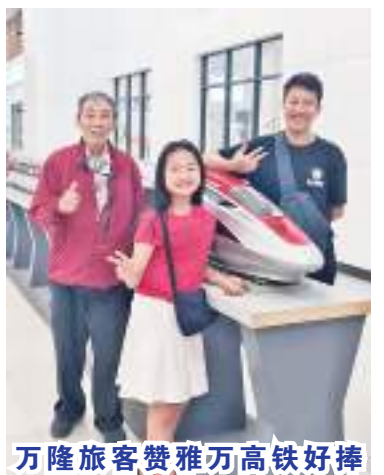
万隆旅客赞雅万高铁好棒