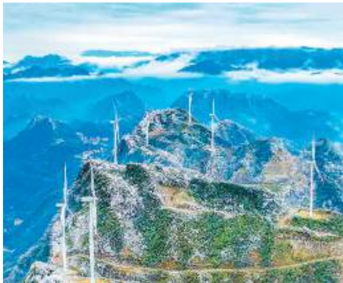
重庆市万盛经开区石林镇，风电机组与绿色群山、晨雾和蜿蜒公路相映成景。

汽车产业发展规划，起步至今10余年，中国新能源汽车产业发展迅猛，已连续8年稳居全球新能源汽车产销规模第一。今年1至11月，新能源汽车产销量分别达842.6万辆和830.4万辆，同比分别增长34.5%和36.7%，市场占有率达30.8%。 专家表示，中国新能源汽车已进入全面市场化发展的关键阶段。接下来，应积极推动新能源和智能网联汽车创新发展，进一步优化行业管理政策、打造一流营商环境，持续推动新能源汽车产业高质量发展。