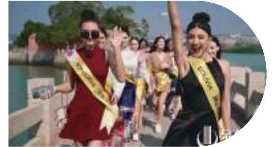
世界旅游小姐全球總決賽參賽選手走進世遺泉州