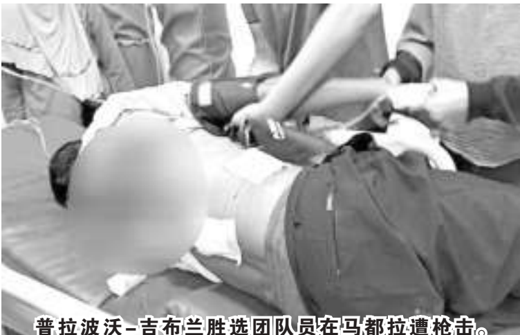
普拉波沃-吉布兰胜选团队在马都拉遭枪击。