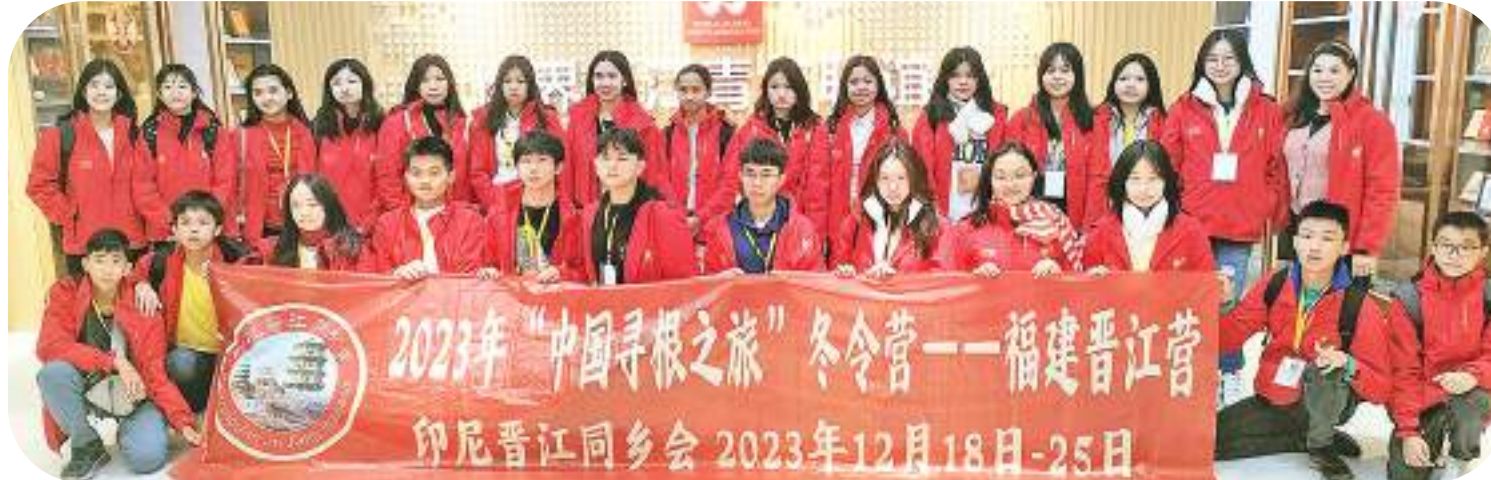
营员们参访世界晋江青年联谊会时合影