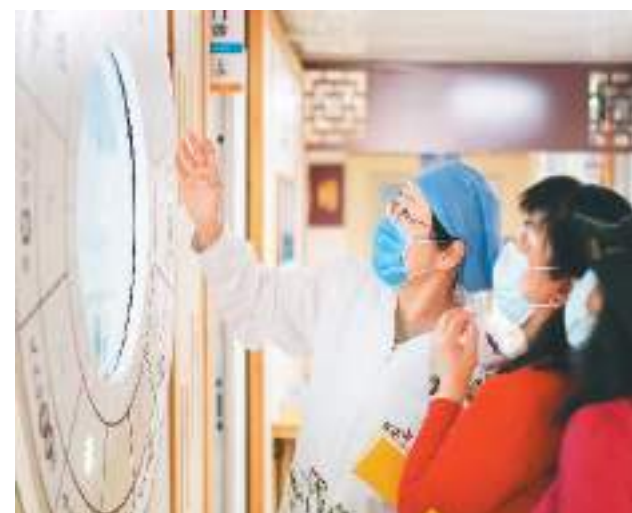
12月8日，北京市居民在丰台区成寿寺街道社区卫生服务中心举办的“中医药文化科普活动”中利用互动设备学习中医知识。

通知提出进一步加强中医医院儿科建设，到2025年，实现全国三级中医医院、中西医结合医院80%以上设置儿科。