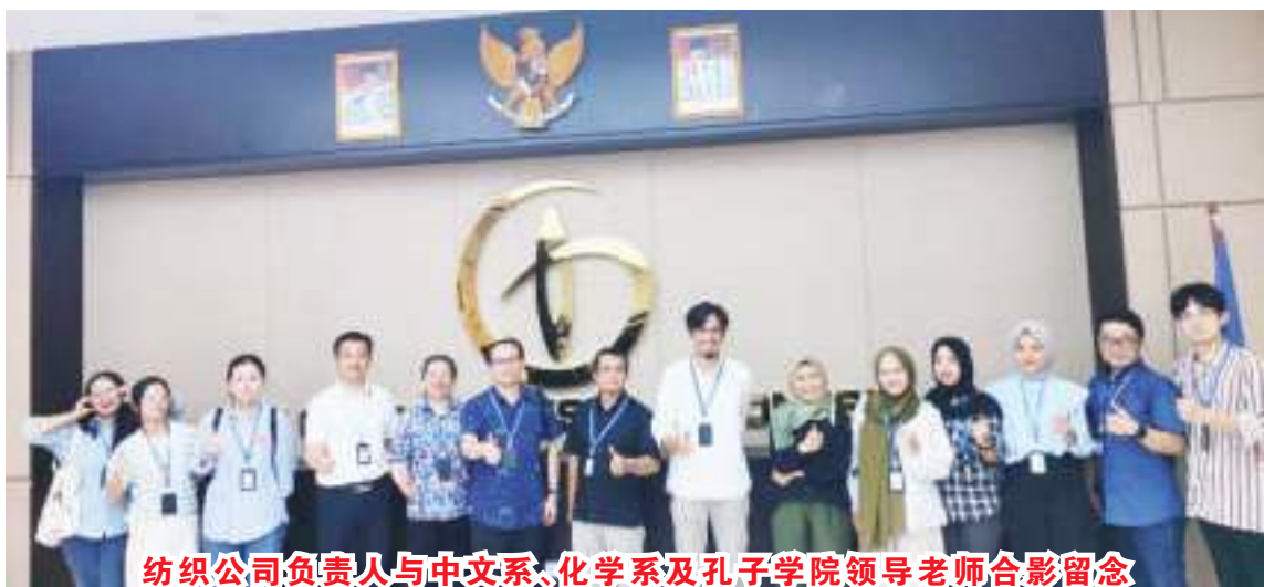
纺织公司负责人与中文系、化学系及孔子学院领导老师合影留念