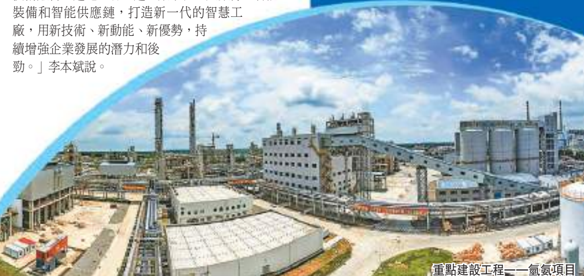
重點建設工程——氫氣項目