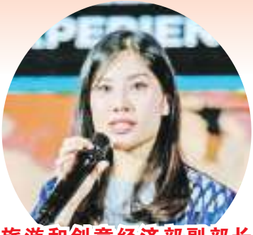
旅游和创意经济部副部长 安琪拉

【本报讯】旅游和创意经济部/旅游和创意经济局，于周五(22/12/2023)在雅加达 SaptaPesona 大楼举行2023年年终新闻发布会。