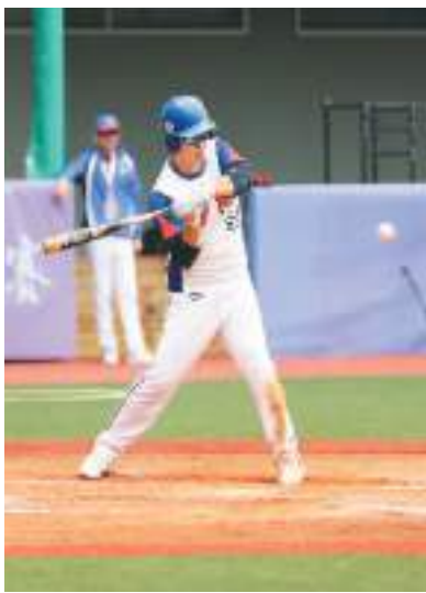
图为在浙江绍兴举行的“2023海峡两岸学生棒球邀请赛”揭幕战上，参赛选手挥棒击球。

初冬时节，南京扬子江畔高朋满座，气氛热烈。2023两岸企业家峰会10周年年会如约登场，约800位两岸各界嘉宾与会。近年来，大陆加快构建新发展格局，致力于扩大内需，推动高质量发展，产业科技创新和供应链自主可控，带来了两岸企业携手合作、共创新局的契机；两岸应深化经贸合作，协同参与全球价值链分工，共同应对国际贸易挑战……详实的数据，具体的事例，精辟的观点，有力论证了两岸经济融合发展的成果与前景。这一年，越来越多的台商看好大陆发展机遇，在这里投资兴业，寻找市场。10月下旬，第一届海峡两岸农业交流大会在福建漳州举行，会上签约了两岸农业合作项目25个，项目总投资额58亿元，主要涉及台湾名优农产品种植、农产品加工、三产融合等领域；7月，2023浙江·台湾合作周在浙江杭州开幕，10个投资项目在主场签约，投资额达24.1亿美元，全省签约投资项目总数为40余个，投资总额41.1亿美元……商务部数据显示，今年前10个月，两岸贸易额达到近2200亿美元，大陆新设台企同比增长21.8%，实际使用台资金额同比增长超过40%。