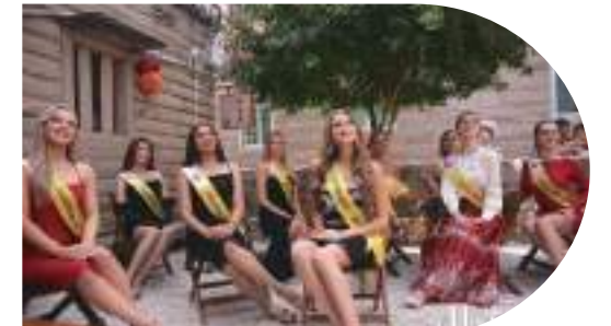
世界旅游小姐全球總決賽參賽選手走進世遺泉州