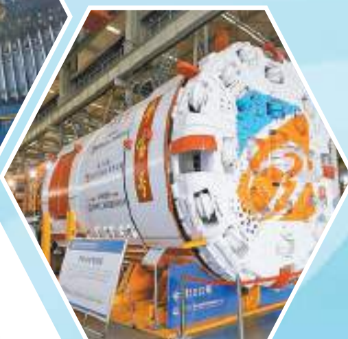
▲「平實號」盾構機月進尺623米，再次刷新河南省紀錄，達到國內先進水平。