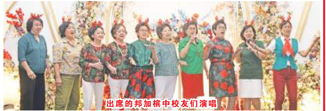
出席的邦加模中校友们演唱