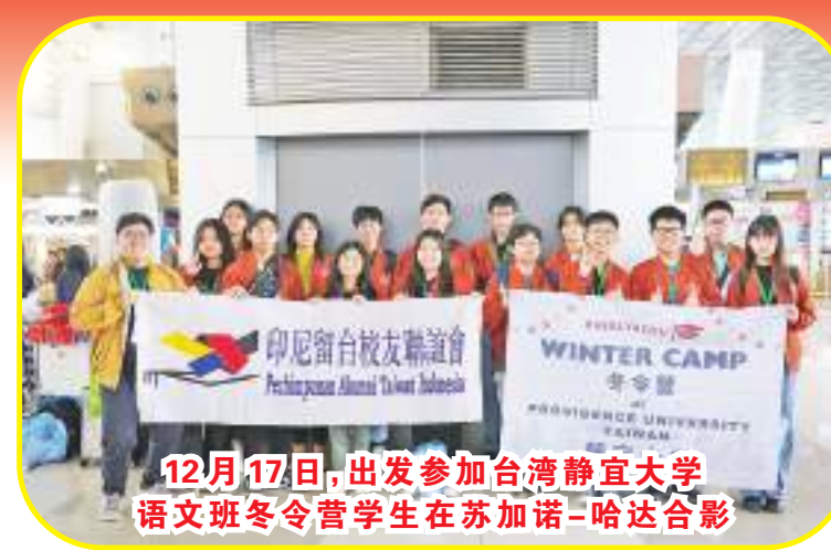
12月17日,出发参加台湾静宜大学语文班冬令营学生在苏加诺-哈达合影

环境探索与政经建设参访等,让海外学子能在活泼的教学课程与体验中学习,认识台湾教育环境、增进海外青年对台湾之认识,并欢迎未来来台