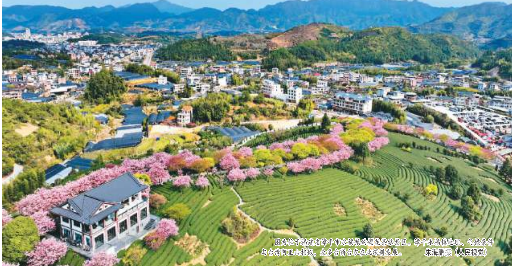
图为位于福建省漳州市永福镇的樱花茶旅景区。漳州永福镇地理、气候条件与台湾阿里山相似，众多台商农企在此深耕发展。

中国闽台缘博物馆位于福建泉州，是以反映祖国大陆与台湾历史关系为专题的国家一级博物馆。目前，该馆已从台湾征集和接受台湾同胞捐赠藏品超过6800件（套）。