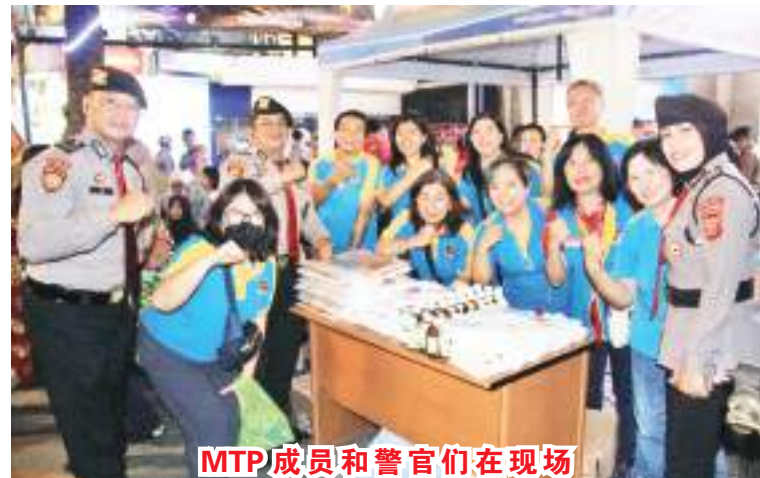
MTP成员和警官们在现场