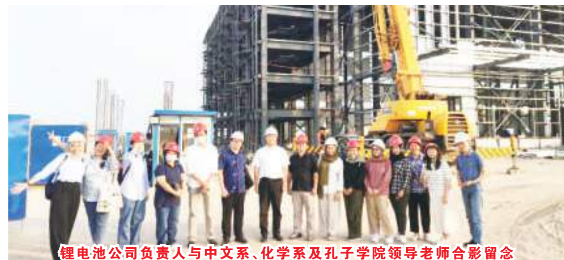
锂电池公司负责人与中文系、化学系及孔子学院领导老师合影留念