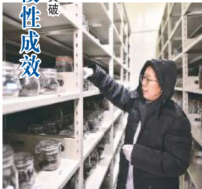
西藏种质资源库采集和保存了青藏高原及其邻近地区农作物、野生生物等各类生物种质资源2047种8458份。种质资源库的建立与运行，对西藏生物种质资源的保存和研究、西藏生物多样性保护起到积极的基础支撑作用。图为科研人员在整理种子低温保存库中储存的各类种子。

种业知识产权保护力度明显加大。贯彻实施新修改种子法，加快建立实质性派生品种制度，推动出台侵权案件审理司法解释和涉种刑事审判指导意见，强化行政和司法衔接机制，植物新品种保护制度体系进一步健全。联合公检法等有关部门推出严厉打击假冒劣、套牌侵权等违法行为“组合拳”，扎实开展种业监管执法年活动和知识产权保护、“仿种子”清理、品种审定试验专项整治，发布典型案例，种业打假维权意识明显增强，激励保护创新氛围持续向好。