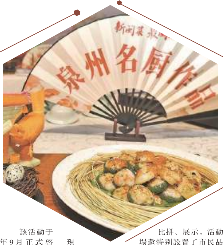
該活動于今年9月正式啓動,設置名廚、名菜、名店、名小吃4大推選項目,面向全市徵集優秀參賽者(項目),採取“1+N”模式,即中心市區設立1個總決賽主會場,各縣(市、區)設立選拔賽分會場。活動啓動以來,受到社會各界廣泛關注和泉州各縣(市、區)商務主管部門的大力支持,安溪縣、南安市、永春縣、泉港區、晉江市、石獅市相繼組織舉辦山海廚王爭霸賽分賽,並邀請專業評委,評出分賽區“廚王”“廚星”。

結合縣(市、區)商務主管部門、餐飲行業協會推薦與企業自薦,最終,近300個報名項目入圍2023泉州山海廚王爭霸賽暨“最閩南”美食系列活動總決賽。其中,名廚、名菜、名小吃三大項目于昨天進行現場烹飪、