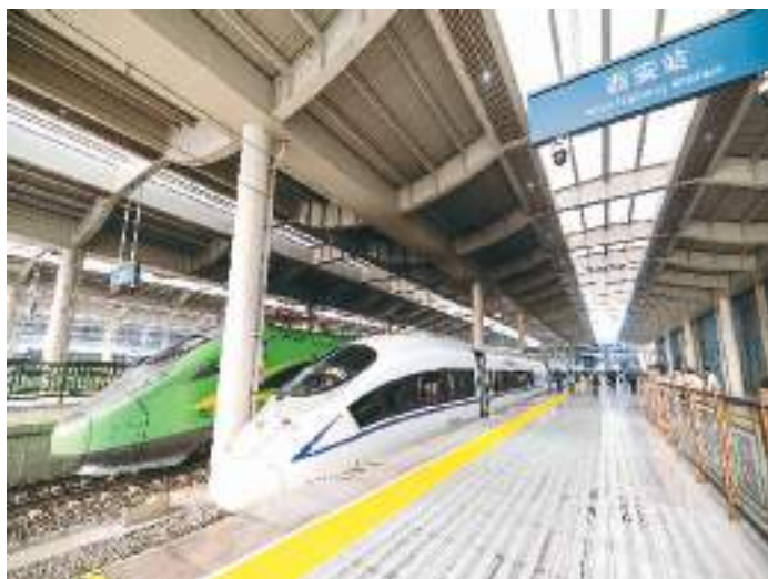
10月11日，陕西西安，西安站开行的首趟进京高铁动车组G654次即将发车驶向北京西站，标志着西安站正式开行进京高铁。

16.4%。调查显示，开展网络直播、微商电商等线上经营的个体工商户占比较年初提升了5.7个百分点。 作为稳就业、促增长、惠民生的重要力量，个体工商户的发展受到各地区各部门高度关注。今年7月，市场监管总局等14部门联合开展“全国个体工商户服务月”活动，组织各地区相关部门为个体工商户提供招工用工、技能培训、政策咨询、贷款融资等多样化服务。年初以来，各地也相继出台政策支持个体工商户发展，着力解决个体工商户遇到的办事难题。 新的一年即将到来，期待更多涌动着勃勃生机“小店”出现。