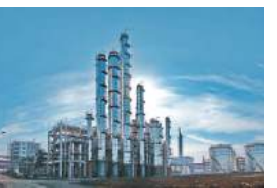
工藝技術國內領先、綠色循環經濟產業鏈完整的雙30萬噸己二腈己內酰胺生產基地——尼龍科技公司

接連突破「卡脖子」的技術封鎖，源自長期堅持自主科技創新積累的底氣。神馬股份早在1996年就成立了國家級企業技術中心，目前擁有博士後工作站、尼龍新材料產業研究院、尼龍纖維、中間體、工程塑料全流程重點實驗室等一批研究中心、重點實驗室，先後承擔十餘項國家863計劃、973計劃等重要研發項目，負責二十多項產品的國家及行業標準制定。神馬股份還積極與高校、科研院所等機構開展產學研合作，先後開發出阻燃織