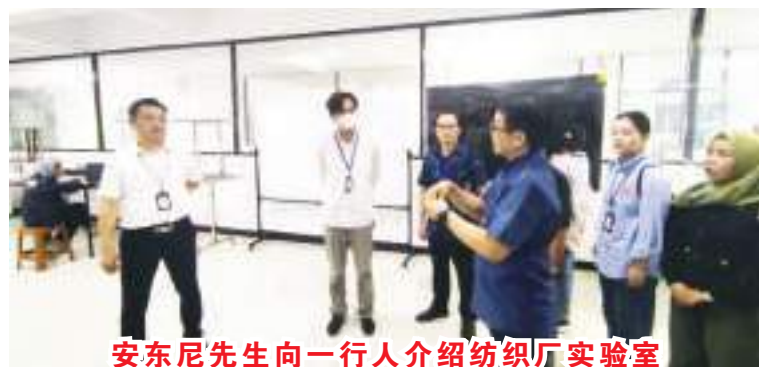
安东尼先生向一行人介绍纺织厂实验室