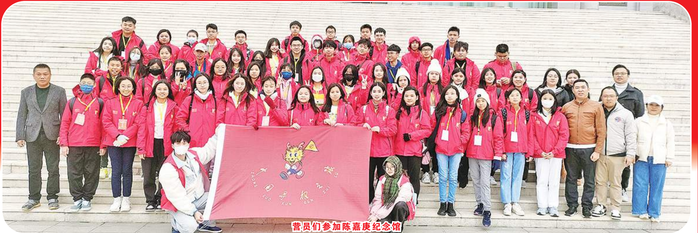
营员们参加陈嘉庚纪念馆

【本报讯】由中国侨联主办,福建省侨联、泉州市侨联、晋江市侨联、晋江市人民政府侨务办公室承办,泉州职业技术大学、马来西亚晋江社团联合会、印尼晋江同乡会、世界晋江青年联谊会协办的2023“中国寻根之旅”冬令营(福建晋江营),于12月19日在泉州职业技术大学开营。