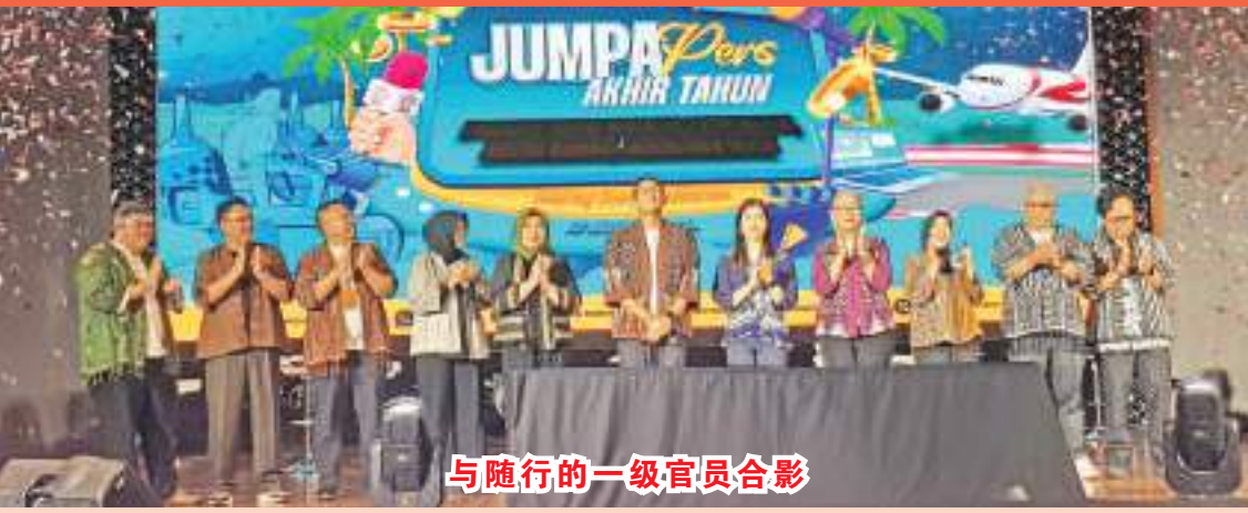
与随行的一级官员合影