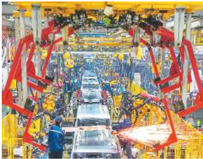
在江西省赣州市经济技术开发区一家新能源汽车制造公司冲焊生产线上，工人们进行焊接作业。

利，截至11月底第一批已建成并网4516万千瓦，第二批、第三批已核准超过5000万千瓦，正在陆续开工建设。全国风光总装机突破10亿千瓦，在电力新增装机中的主体地位更加巩固，户用光伏规模突破1亿千瓦、覆盖农户500多万。 土耳其亚太研究中心主任塞尔丘克·乔拉克奥卢称赞道，中国加快向能源绿色低碳转型的步伐，推广应用风电、太阳能光伏发电等可再生能源技术，取得了巨大进展，“中国引领全球可再生能源发展，全球可再生能源产业的重心正在向中国倾斜”。