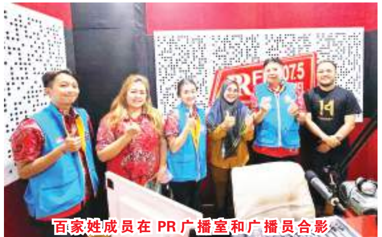
百家姓成员在PR广播室和广播员合影