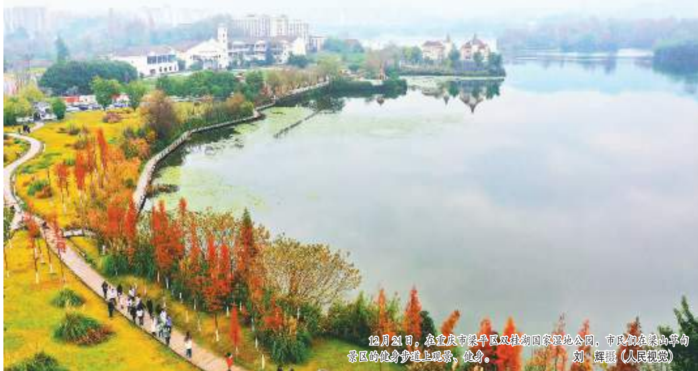
12月21日，在重庆市梁平区双桂湖国家湿地公园，市民们在梁山亭景区的健身步道上观景、健身。