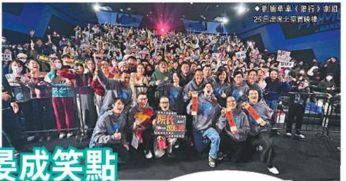
劉德華率《潛行》劇組25日出席北京首映禮。

香港文匯報訊(記者阿祖)由劉德華監製兼主演、關智耀執導的動作犯罪電影《潛行》25日於北京舉行首映禮，華仔率領一眾演員包括林家棟、彭于晏(Eddie)、劉雅瑟、任達華、姜皓文、林雪、朱鑑然及劉俊謙等出席，一起在工作中度過了一個充滿熱鬧氣氛的聖誕節。而電影《流浪地球》的導演郭帆亦有現身捧場。