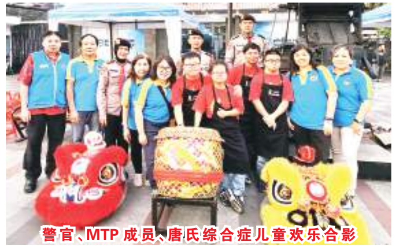
警官、MTP成员、唐氏综合症儿童欢乐合影