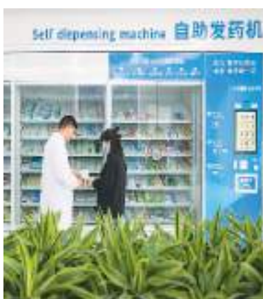
10月20日，浙江金华开发区苏孟乡和悦社区卫生服务智慧健康驿站，医生指导居民自助购买药品。

今年5月，国家卫健委等部门宣布启动实施为期三年的“改善就医感受、提升患者体验”主题活动。活动方案从患者视角出发，围绕看病就医全流程，覆盖各级医院和广大城乡基层医疗卫生机构，开展提升患者诊前体验、门诊体验、急诊急救体验、住院体验、诊后体验、医疗服务全程基础支撑等6方面20条举措，全链条、全覆盖、全程式改善群众医疗服务就医感受。 目前，82.7%的二级以上公立医院开展预约挂号服务，全国三级医院平均预约挂号率达到49.2%；全国超过5500家的二级以上综合医院实现“一站式”综合服务方式……活动开展以来，各地多措并举打通百姓就医堵点、难点，群众就医获得感、幸福感、安全感进一步增强。