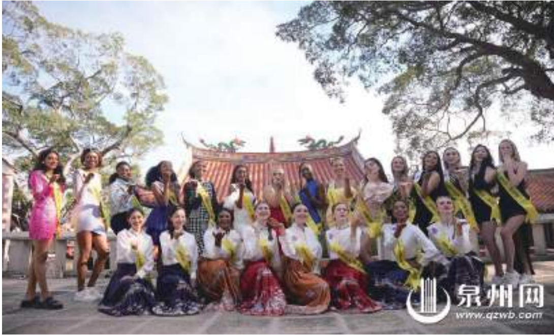
世界旅游小姐全球總決賽參賽選手走進世遺泉州

泉州網12月15日訊(記者高慧子)今天下午,世遺泉州文化旅游宣傳周啓動儀式暨2023世界旅游小姐全球總決賽入城儀式將舉行!15日—22日,各國旅游小姐冠軍齊聚泉