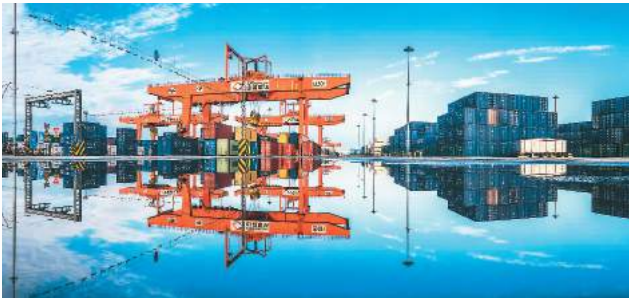
成都国际铁路港雨水倒影，如梦如画。