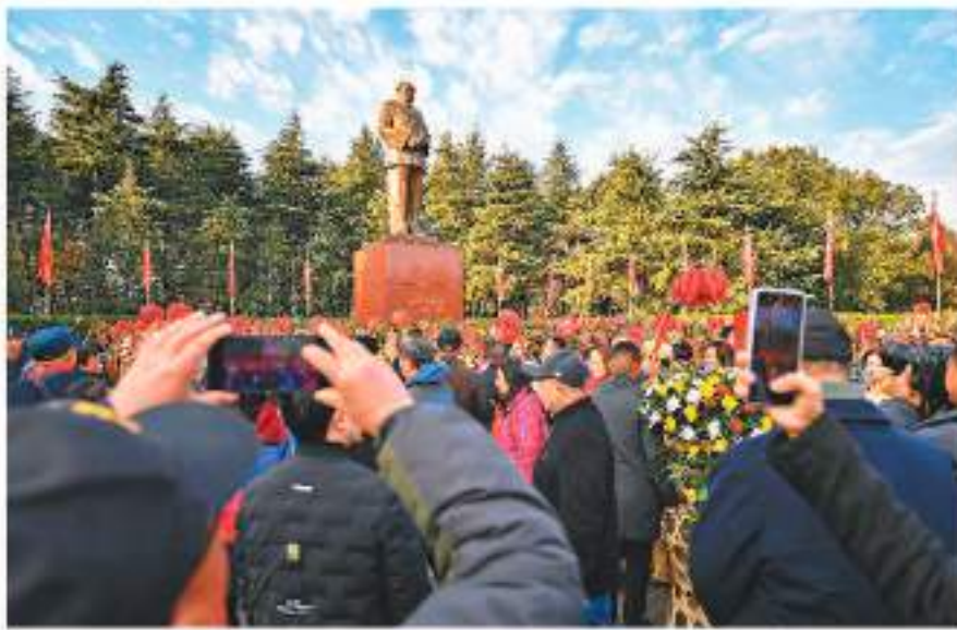
12月26日，人們在湖南韶山毛澤東銅像廣場參觀，當日，社會各界人士來到湖南韶山，瞻仰毛澤東銅像，參觀毛澤東故居，紀念毛澤東同志誕辰130周年。

習近平強調，改革開放是當代中國大踏步趕上時代的重要法宝，是決定中國式現代化成敗的關鍵一招。推進中國式現代化，必須進一步全面深化改革，不斷解放和發展社會生產力，解放和增進社會活力，要順應時代發展新趨勢、實踐發展新要求，人民群眾新期待，以改革到底的堅強決心，動真格、敢碰硬，精準發力、協同發力，持續發力，堅決破除一切制約中國式現代化順利推進的體制機制障礙，全方位為中