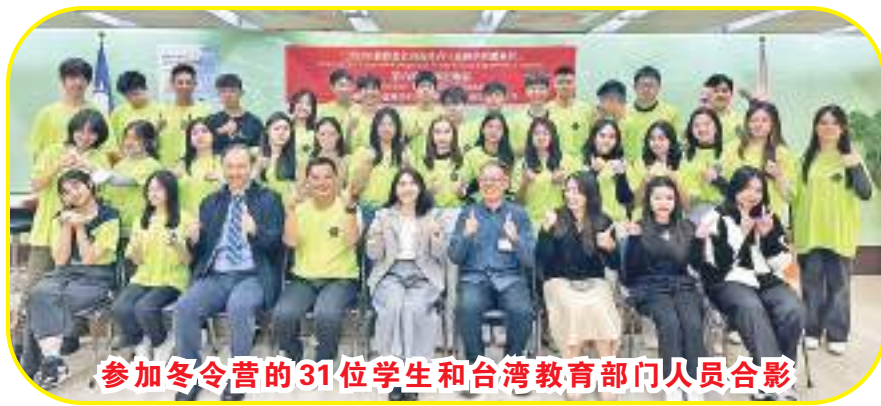
参加冬令营的31位学生和台湾教育部门人员合影