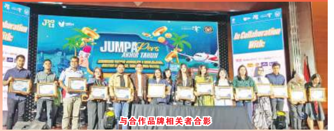
与合作品牌相关者合影