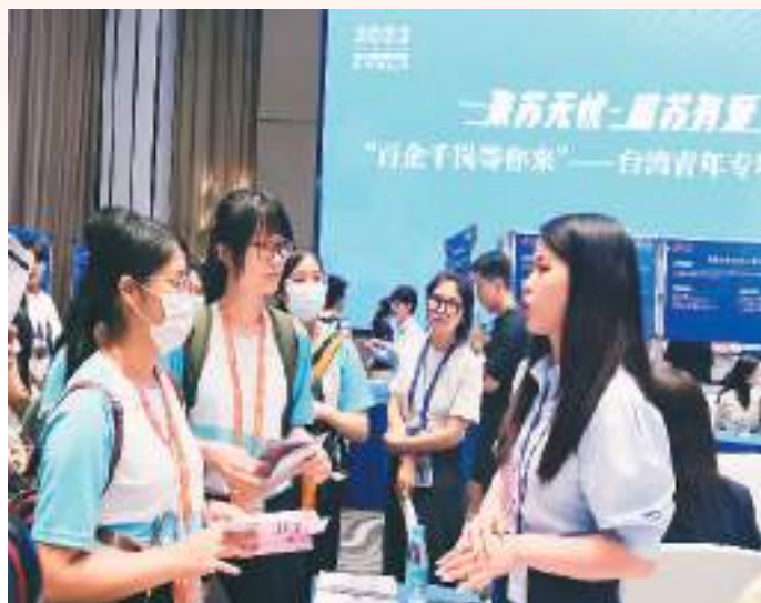
图为台湾青年在江苏苏州举办的“百企千等你来”专场招聘会上选择工作岗位。