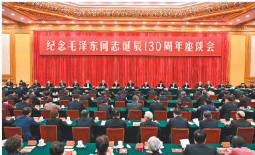
12月26日，中共中央在北京人民大會堂舉行紀念毛澤東同志誕辰130周年座談會。習近平、李強、趙樂蔭、王麗華、蔡奇、丁薛祥、李希、韓正等出席座談會。習近平發表重要講話。

香港文匯報訊 據新華社報道，中共中央26日上午在人民大會堂舉行座談會，紀念毛澤東同志誕辰130周年。中共中央總書記、國家主席、中央軍委主席習近平發表重要講話。他強調，毛澤東同志是偉大的馬克思主義者，偉大的無產階級革命家、戰略家、理論家，是馬克思主義中國化的偉大開拓者、中國社會主義現代化建設事業的偉大奠基者，是近代以來中國偉大的愛國者和民族英雄，是黨的第一代中央領導集體的核心，是領導中國人民徹底改變自己命運和國家面貌的一代偉人，是為世界被壓迫民族的解放和人類進步事業作出重大貢獻的偉大國際主義者。毛澤東思想是我們黨的寶貴精神財富，將長期指導我們的行動，對毛澤東同志的最好紀念，就是把他開創的事業繼續推向前進。