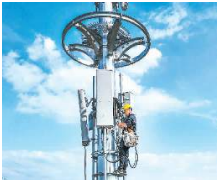
工作人员在浙江省台州市仙居县现代工业园区铁塔上安装5G设备。

自今年3月起，单月快递量超百亿件，月均业务收入超900亿元，创下新高。11月进入业务旺季，快递行业保持高位运行，日均快递业务量超4.3亿件，在打通产销通道、贯通供需两端、连通线上线下、畅通内外循环等方面发挥越来越大的作用。 快递“小包裹”跑出了“大跨越”。近年来，中国快递业保持稳健增长势头，业务量实现了从“年均百亿”到“月均百亿”的巨大跨越，国际化水平快速提升，快递服务网络通达全球，已经成为现代物流领域覆盖面最广、综合运输方式应用最好、信息化智能化水平最高、生产效率提升最快的代表性行业。