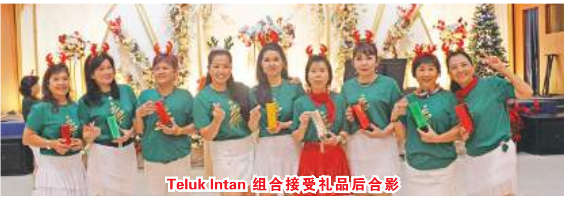
Teluk Intan 组合接受礼品后合影