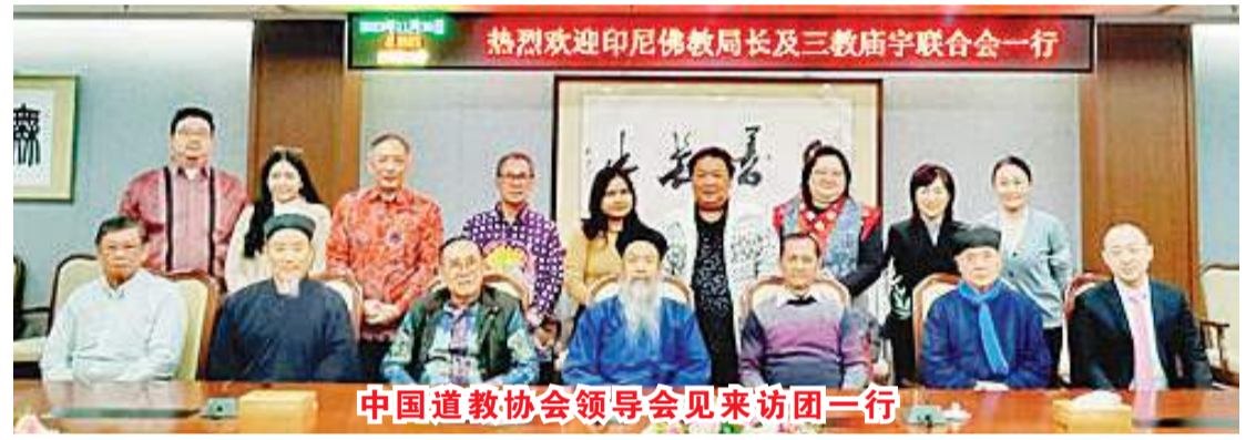
中国道教协会领导会见来访团一行