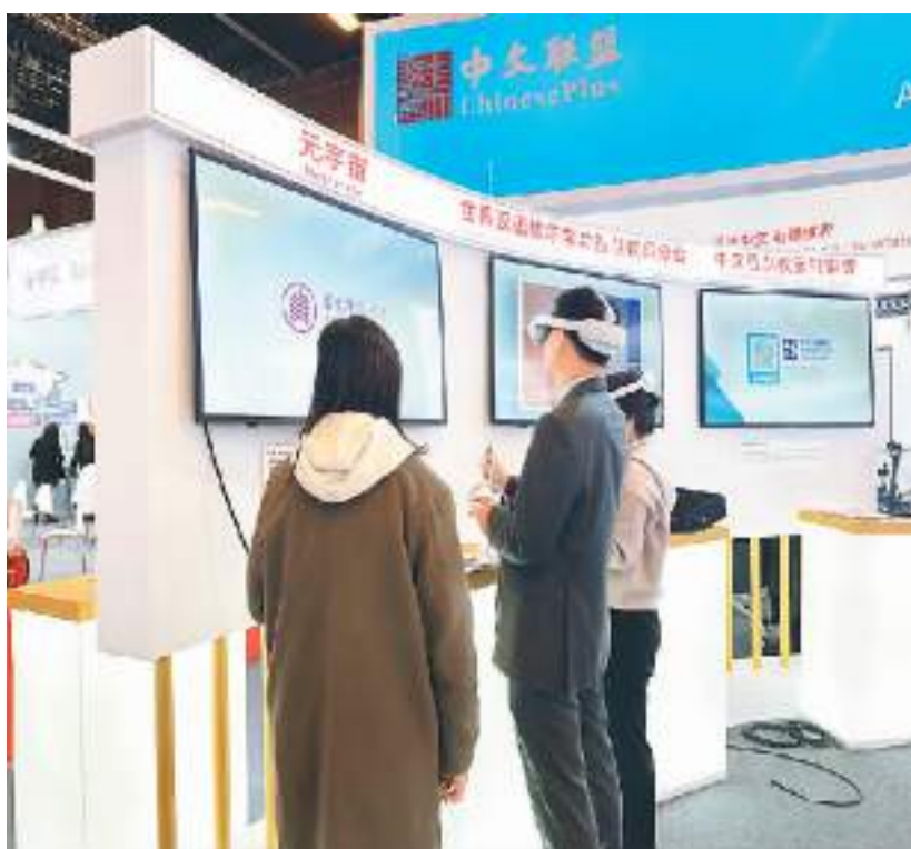
日前，世界中文大会语言展在北京国家会议中心举行。图为观众在现场体验。