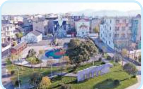
位於陳營鎮老街社區四方崗小區的書香公園。

萬年縣委書記毛奇強調，要堅持以學促幹，開創發展新局，堅持主題教育和中心工作「兩手抓、兩促進」，抓實「黨建引領走前列」行動，抓實「社會治理一體化」行動，抓實「風險隱患大化解」行動，抓實「為民服務在身邊」行動，強化組織保障、責任保障、紀律保障，確保「大抓基層年」活動高效開展，書寫「四下基層」新答卷。