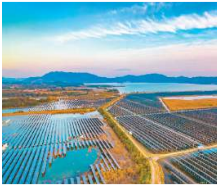
江西省新余市近年来持续推进光伏电站、风力电场、生物能发电等新能源项目建设，加快绿色能源低碳转型步伐，形成一道道亮丽的低碳风景线。图为新余市分宜县横溪70兆瓦渔光互补光伏电站与周边山川、湖泊、霞光相映成景。

织、世界气象组织签署可持续交通、知识产权、气象等方面合作文件等。三是双边合作平台、中方发起合作项目及机制类，主要包括建立“一带一路”企业廉洁合规评价体系、中国—中亚五国交通部长会议机制、中国—柬埔寨铁路合作工作机制，上线中欧班列门户网站等。四是合作项目实施类，主要包括在柬埔寨建设暹罗哥国际机场项目、投资赞比亚江西经济合作区项目等。五是民生及民心相通类项目，主要包括开展“一带一路”银行监管研讨班、印尼工业化职业培训项目，向莫桑比克、乍得等国提供紧急粮食援助等。六是发布白皮书和研究报告类，主要包括发布《共建“一带一路”：构建人类命运共同体的重大实践》《坚定不移推进共建“一带一路”高质量发展走深走实的愿景与行动——共建“一带一路”未来十年发展展望》等。