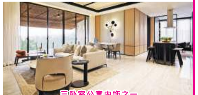
三卧室公寓内饰之一