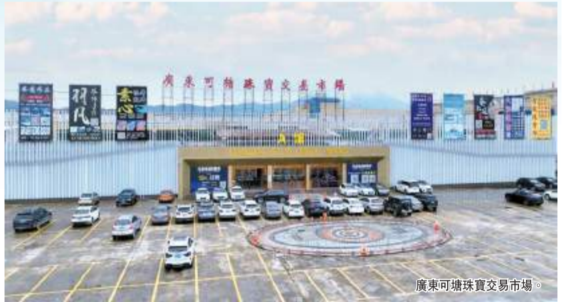
廣東可塘珠寶交易市場。

近年來，汕尾市海豐縣珠寶首飾電商行業逐漸應用了機器人和AI技術，可塘抖音基地名列全國抖音直播帶貨前三位，電商從業人員眾多，網紅達人、明星經常到海豐進行線上帶貨直播。海豐金銀首飾加工和彩色寶石加工產業已插上了電商的翅膀，帶旺了海豐的商業消費和房地產，為海豐社會經濟發展作出了巨大貢獻。 余麗齡