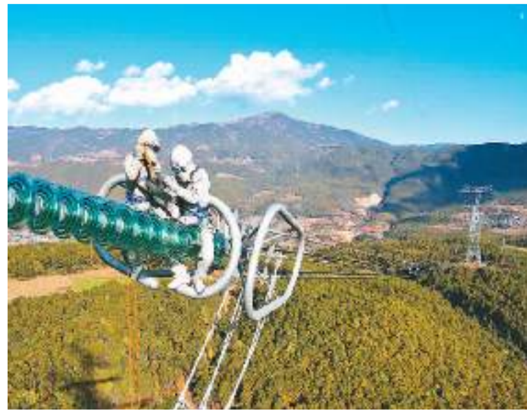
今年以来,南方电网超高压输电公司大理局强化电力保供,开展高海拔(特)高压直流带电作业45次,消除缺陷49条,有效减少停电时间,保障企业和居民的用电需要。图为该公司工作人员在云南省大理白族自治州马耳山海拔3404米地带开展±800千伏新东直流带电更换玻璃绝缘子作业。

该负责人指出,国家铁路煤炭发送量持续增长,凸显我国经济运行总体回升向好的态势。国铁集团将密切关注发电、供暖企业用煤情况,切实做好迎峰度冬保供运输组织,为人民群众温暖过冬和国民经济平稳运行提供有力支撑。