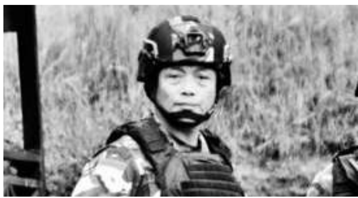
巴布亚第十七军区司令伊萨少将(Izak Pangemanan)。