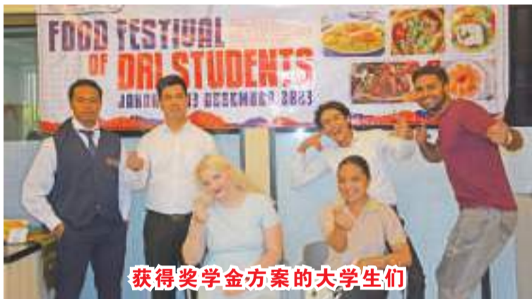
获得奖学金方案的大学生们

【本报讯】大约四个月前，七名获得奖学金方案的男女大学生，在特里萨克蒂旅游学院学习。