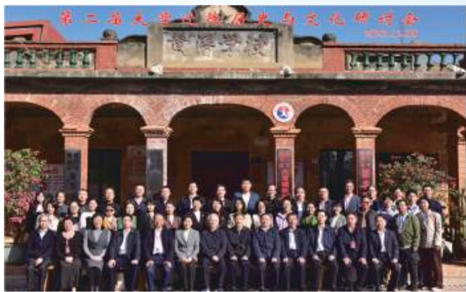
第二屆大學遷徙歷史與文化研討會參會嘉賓合影

2023年12月8日，由中國大學遷徙紀念館(籌)、廈門大學教育研究院、蘭州大學高等教育研究院聯合舉辦的“第二屆大學遷徙歷史與文化研討會”在廈門翔安區黃厝村和廈門大學兩地先後舉行。本次與會嘉賓有中國高等教育學會副會長管培俊先生、大連理工大學原黨委書記張德祥教授、中國地質大學(武漢)黨委書記黃曉玫研究員、華中師範大學黨委書記夏立新教授、廣東開封大學原黨委書記羅海鵬教授、銅仁學院原校長侯長林教授、福建省委宣傳部新聞處處長兼福建日報社副總編輯蘭鋒先生，來自商務印書館、人民教育出版社、香港大學、蘭州大學、東北大學、西南財經大學等單位的專家學者，以及地方文化界人士、主辦單位師生等共60多人，共襄盛舉，憶大學遷徙之歷史，頌大學文脈之厚重。