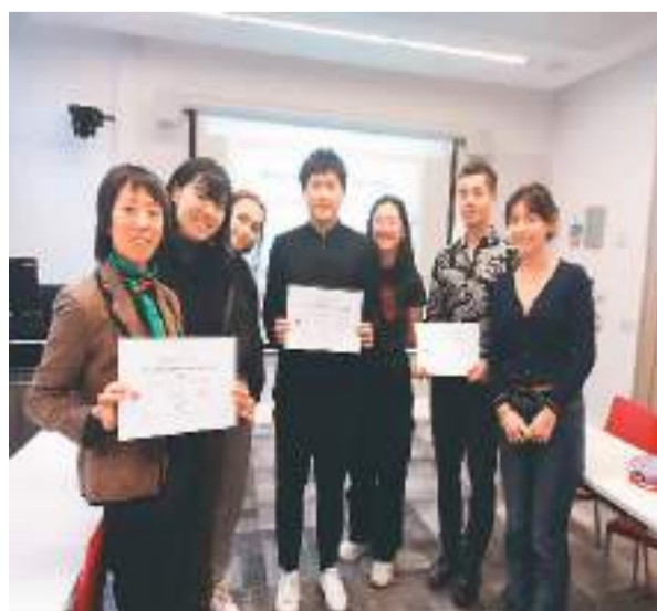
2022年，法国国立东方语言文化学院的师生在英国伦敦政治经济学院领取“透过短片看世界”年度最佳短片奖。