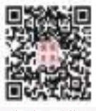
掃一掃，更多精彩新聞與你分享