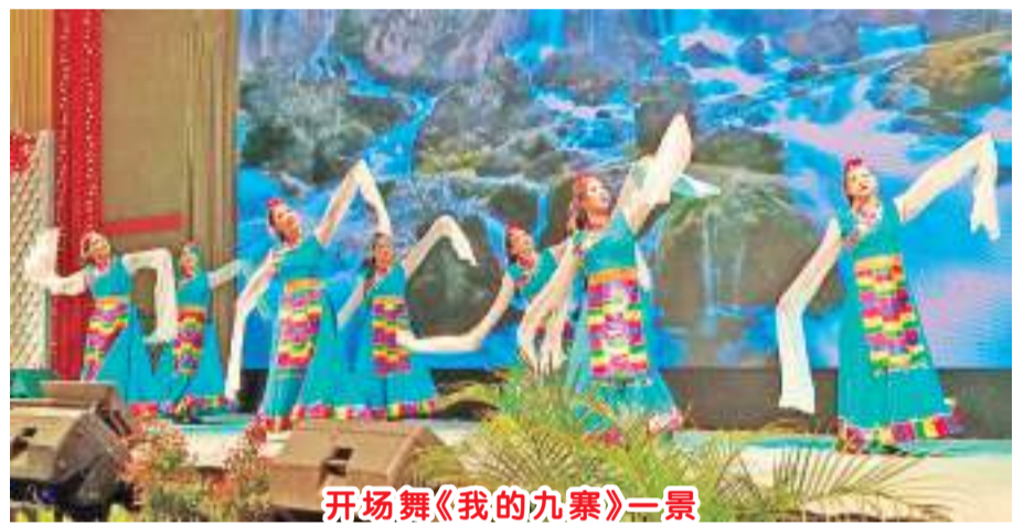
开场舞《我的九寨》一景