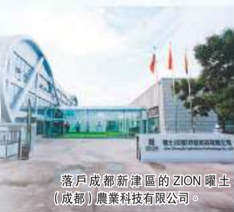
落戶成都新津區的ZION曜土（成都）農業科技有限公司。

走進位於成都市新津區的ZION曜土（中國）總部及研發製造基地，1000平米的展示大廳展陳着公司的發展歷程和優秀的科學家團隊介紹。