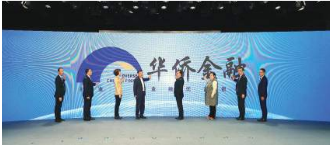
▲2023 年 11 月 28 日，首屆華僑金融助推高質量發展論壇在北京成功舉辦。論壇匯聚國內著名專家學者、知名僑商僑企，共同討論華僑華人在新一輪高水平開放中的積極作用，探索華僑金融服務創新的新模式和新體系。