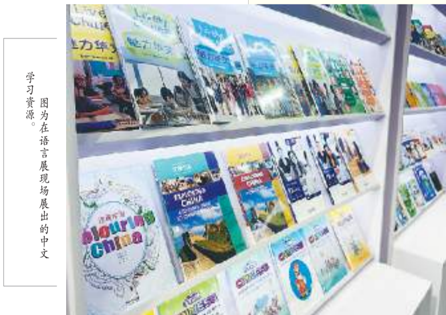
图为在语言展现场展出的中文学习资源。

据了解，这是由河南经贸职业学院联合一涵刺绣公司设立的展区，展出系列非遗刺绣作品，包括双面绣摆件、手工刺绣挂画、双面绣团扇等，色彩缤纷，玲珑别致，在展会上获得不少中外友人的青睐。