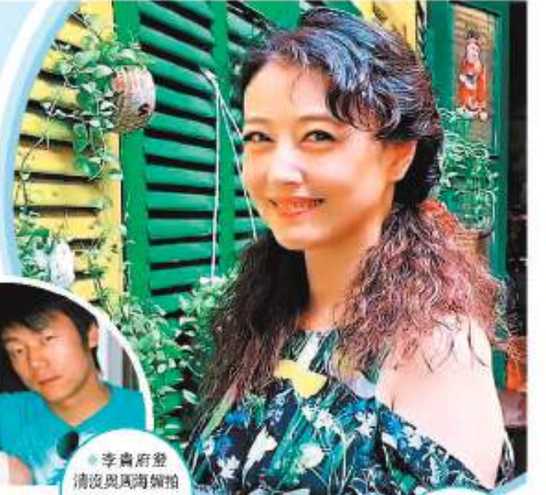
李貴府澄清與周海媚緋聞，網誌截圖

而為悼念周海媚離世，華線J2合作出節目《網劇》。下周一(18日)晚上9時30分特別安排放映周海媚經典之作《大鬧廣昌隆》，以懷念這位深受觀眾喜愛的女藝人。