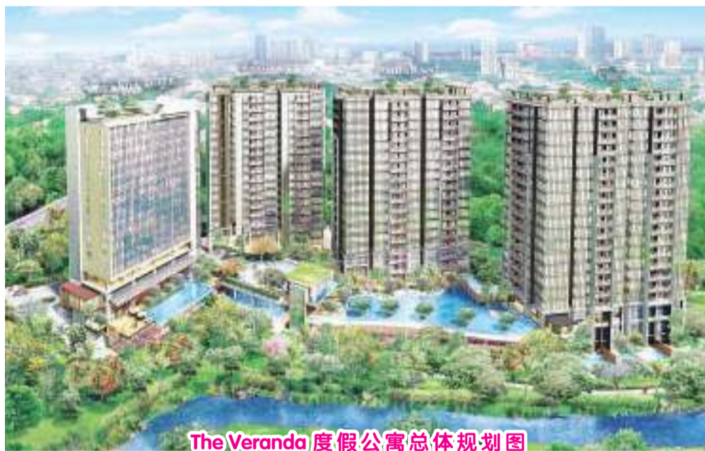
The Veranda 度假公寓总体规划图

开始建造，占地面积2.3公顷。在度假公寓周围准备了70%的绿色开放空间景观，这符合住户居民在一个安全、休闲和健康的地方进行社交和工作的普遍需求。