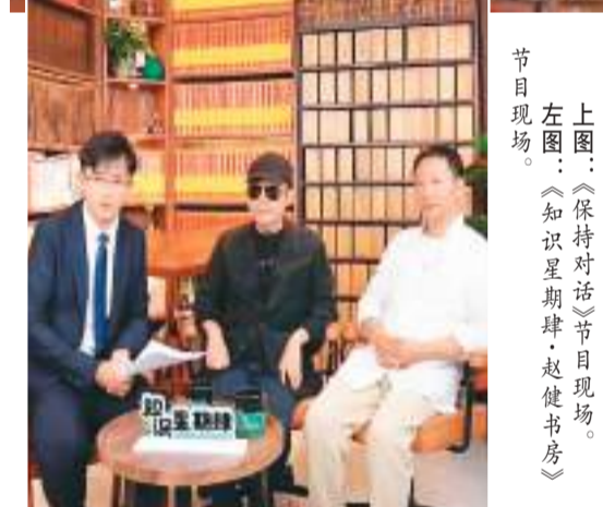
上图：《保持对话》节目现场。 左图：《知识星期肆·赵健书房》节目现场。