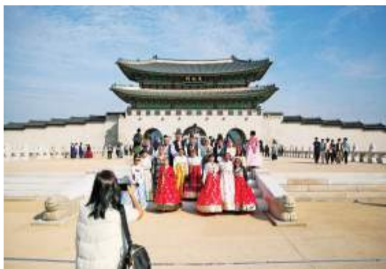
10月18日，游客在韩国首尔光化门前合影留念。

韩国目前总人口约5160万。据《韩国时报》报道，韩国统计厅按三种生育率估算50年后总人口，结果分别为4282万、3620万和3010万。其中，