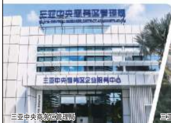
三亚中央商务区管理局