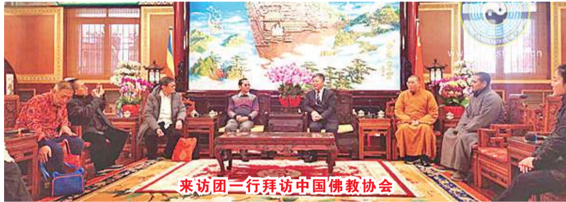
来访团一行拜访中国佛教协会