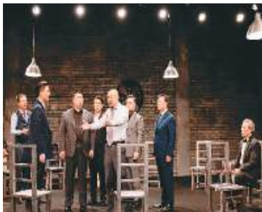
《12个人》剧照。