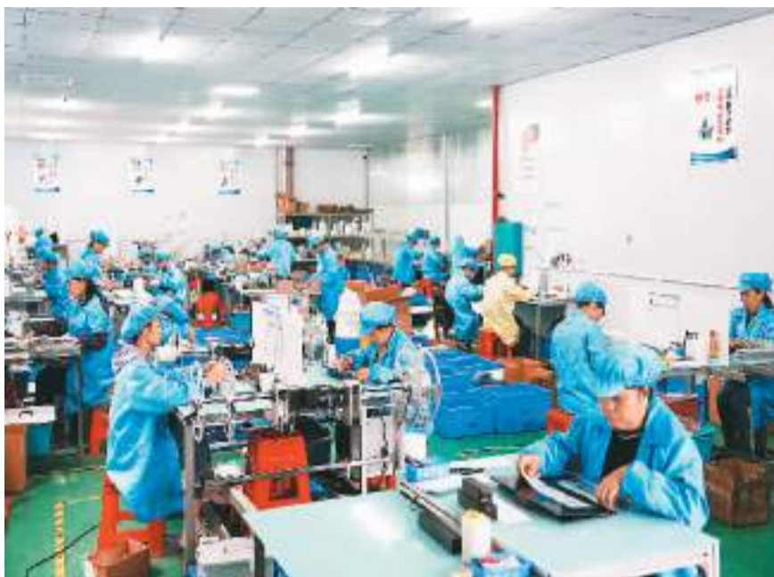
广西玉林容县骏威电子有限公司车间一派忙碌。

今年8月以来，一只只“归巢燕”飞回来了。仅5个月时间，广西壮族自治区玉林市共引进玉商回归项目184个，总投资462.59亿元，带动玉工回归11138人，7个县(市、区)、玉东新区、龙潭产业园区、经济技术开发区等玉商回归产业园分园相继开工建设。