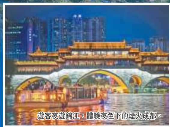
遊客夜遊錦江，體驗夜色下的煙火成都。

香港作為連接內地與國際的「超級聯繫人」，是享譽世界的國際金融、航運、貿易中心，歷來是成都融入世界市場的橋頭堡。隨着成渝地區雙城經濟圈建設的快速推進，成都釋放出更大的空間、更多的機遇。當這兩座城市跨越山海、雙向奔赴，必將迎來新機遇、新活力。 郭代勳