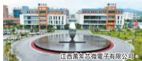
江西萬年芯微電子有限公司。