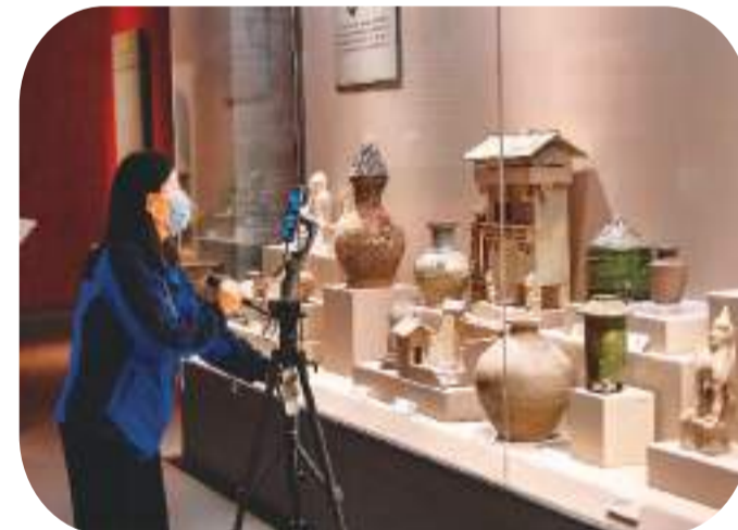
山西运城博物馆的志愿者，通过直播讲解馆藏文物。

和自身材质的差别，采用适合的除尘工具和手法：用柔软的羊毛刷为室内塑像除尘，用气囊吹走文物表面的灰尘。