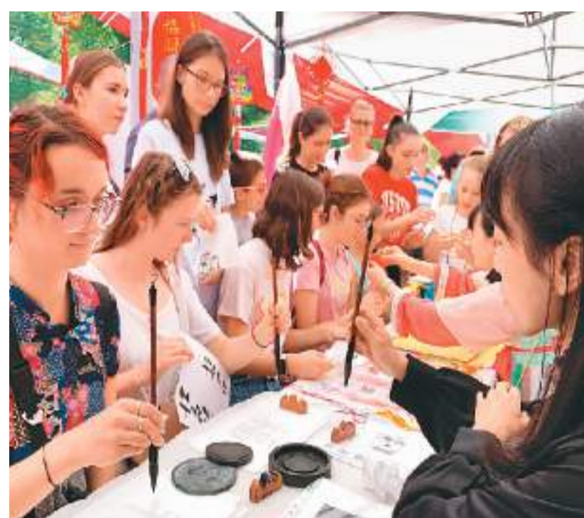
罗马尼亚布加勒斯特大学孔子学院学生参加书法体验活动。布加勒斯特大学孔子学院供图