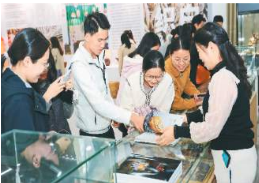
12月7日，在广西玉林博白县首届“博字号”工业博览会上，客商参观了解南流彩玉。