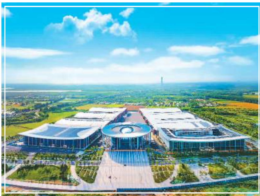
近日，由中建八局二公司承建的山东济南黄河国际会展中心(一期)正式投用。据悉，项目总建筑面积120万平方米，其中一期面积约37.3万平方米，全部建成后净展览面积将达到51万平方米，成为全球净展览面积最大的会展中心，助推济南产业转型和跨越式发展。