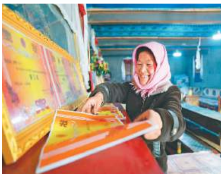
▶ 斯曲卓玛的妈妈在整理孩子们的奖状。