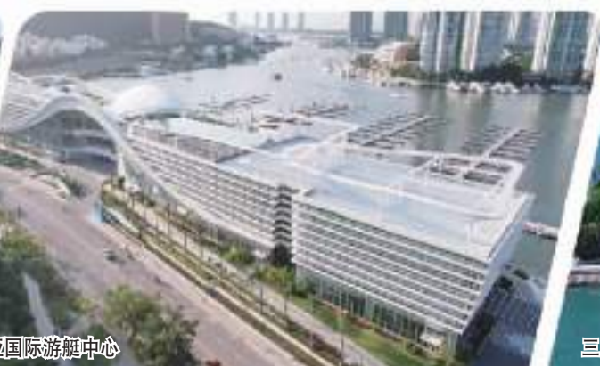
三亚国际游艇中心