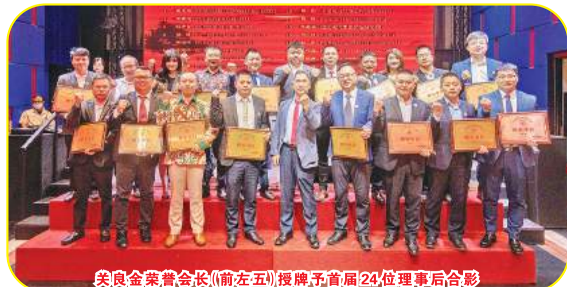
关良金荣誉会长(前左五)授牌予首届24位理事后合影