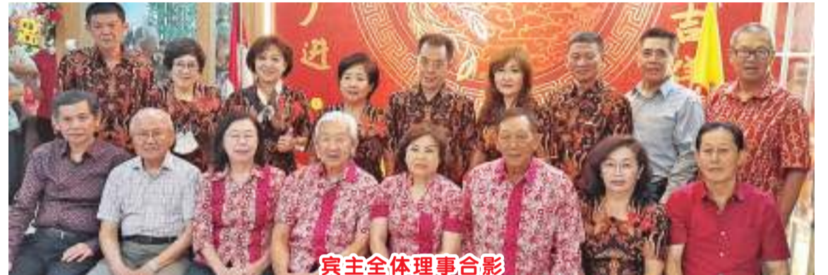
宾主全体理事合影