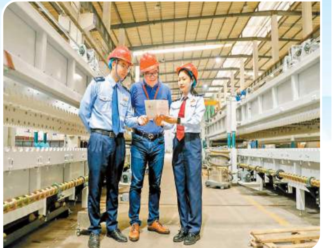
佛山稅務部門工作人員來到索奧斯玻璃技術股份有限公司，了解企業產品及出口業務，宣傳稅收優惠政策。

針對企業投資過程中提出的跨境經營涉稅問題，江門稅務部門聯動派出專家服務團隊，理清中國和馬來西亞稅制差異，為企業量身定製了境外子公司在當地申報應稅收入、境內企業固定資