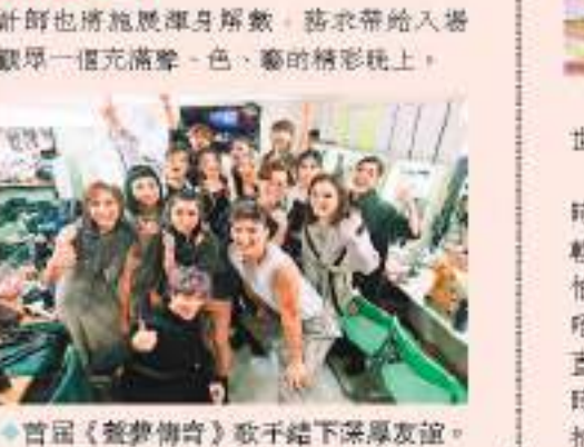
首屆《聲夢傳奇》歌手結下深厚友誼。

今次演唱會海報設計非常破格和有趣，大會先問歌手們如果各自也是一塊拼圖，他們會選擇什麼形狀來代表自己。當中有些是正方形、圓形、星形，甚至是超乎想像的形狀，畫畫時便根據他們提供的答案畫出圖像，然後拼在一起成為海報主畫面，但亦可獨立欣賞每一個圖像，從而了解各人對自己的描述。因他們15人各有各忙，所以他們未曾珍惜這次演唱會能夠令大家聚首一堂的機會。而音樂總監、排舞師和服裝設計師也將施展渾身解數，務求帶給入場觀眾一個充滿聲、色、藝的精彩晚上。