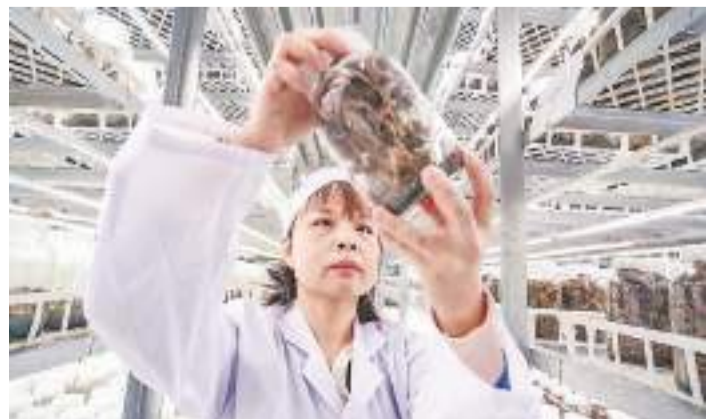
在泉州市金草生物技術有限公司組培車間內，工作人員在查看金錢蓮苗生長情況