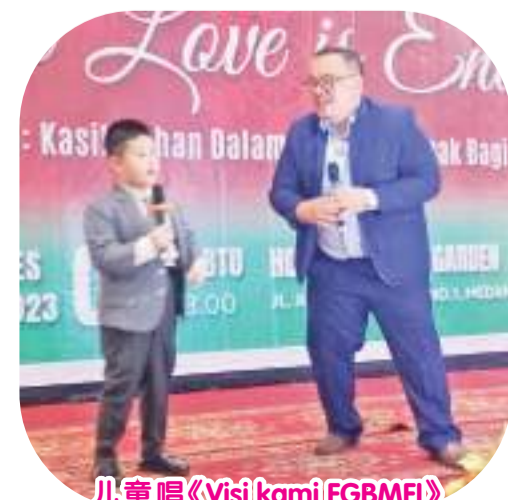
儿童唱《Visi kami FGBMFI》