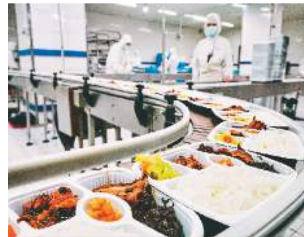
在北京京铁列车服务有限公司配餐基地,一份份高铁盒饭正源源不断从流水线上生产出来。

随着冷链物流与连锁餐饮的发展,易烹即食、省时省事的预制菜逐渐进入公众视野,“预制菜进校园”也曾登上热搜榜。