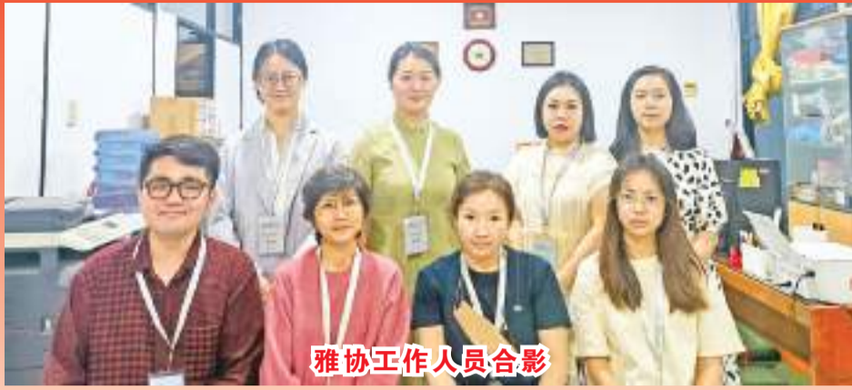
雅协工作人员合影