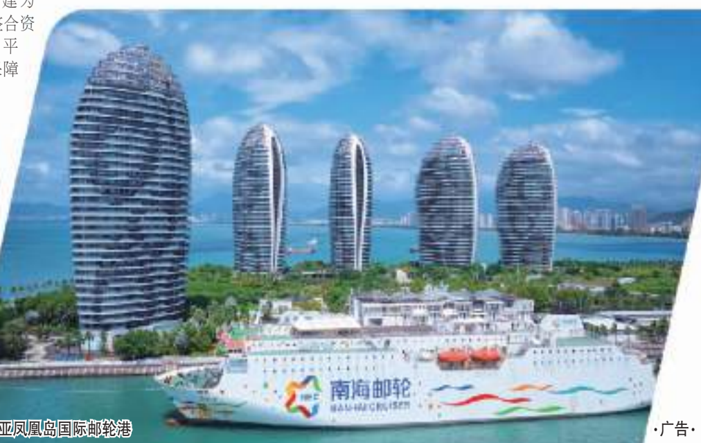
三亚凤凰岛国际邮轮港