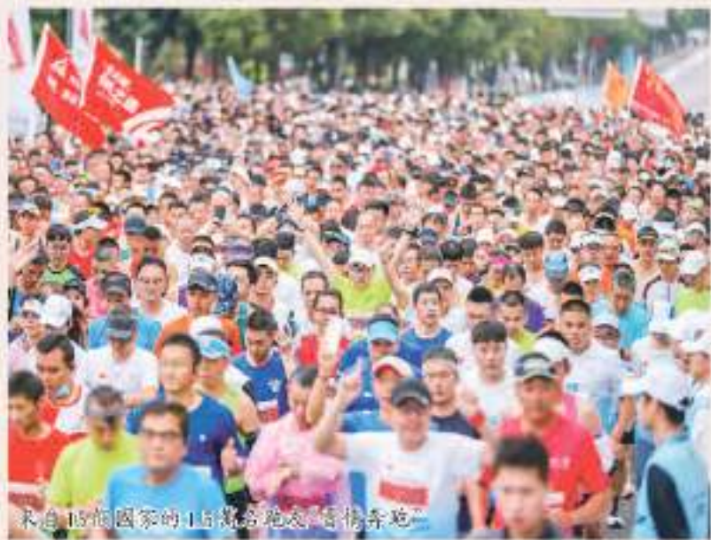
來自 15 個國家的 1.5 萬名跑友，齊集晉江。