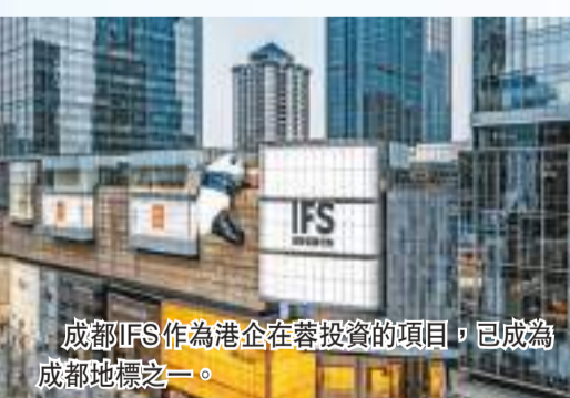
成都IFS作為港企在蓉投資的項目，已成為成都地標之一。

同時，隨着成渝雙城經濟圈釋放出越來越多的機遇，也為香港提供了更多、更廣闊的市場。數據顯