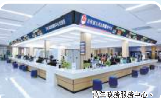
萬年政務服務中心。