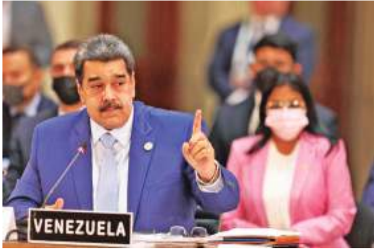
2021年9月18日，在墨西哥首都墨西哥城，委内瑞拉总统马杜罗在第六届拉美和加勒比国家共同体首脑会议上讲话。

新华社北京12月15日电 委内瑞拉总统尼古拉斯·马杜罗和圭亚那总统伊尔凡·阿里14日会晤后发表联合声明，承诺任何情况下都不会用武力解决两国领土争端。