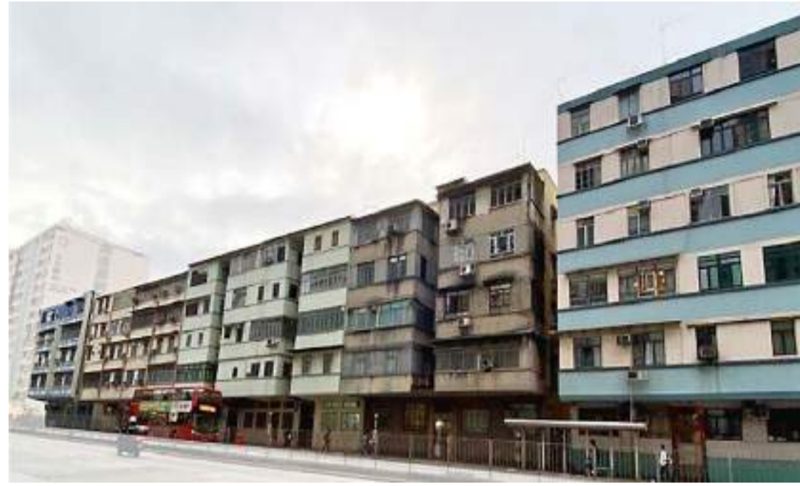
市建局九龍城盛德街/馬頭涌道發展項目原址為公務員建屋合作社地段。

盛德街項目位於馬頭涌道51至77號、盛德街12至34號、及馬頭角道2至4A號，屬於市建局其中一個重建公務員建屋合作社樓宇試點項目，於2020年5月開展並獲政府授權進行。項目佔地約4.6萬平方呎(約4273平方米)，屬商住發展項目，總樓面面積約41.49萬平方呎(約38692平方米)，預計可興建約640個住宅單位。