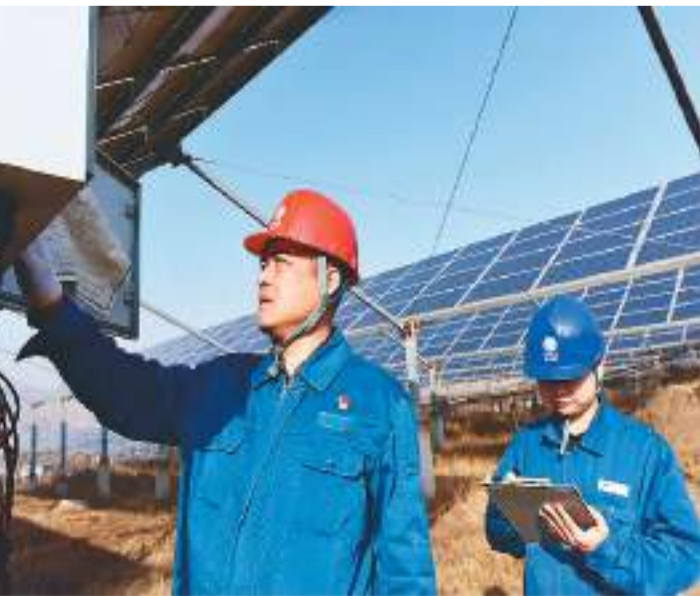
山东省淄博市沂源县大力发展绿色能源产业,目前全县已有风力发电和分布式光伏户9600多户,年均发电量4.1亿千瓦时,年可节约标准煤14.76万吨。图为沂源县供电公司工作人员在沂源县鲁村镇小庄村光伏发电基地检查发电运营情况。

据悉,亚雪公路项目建设总里程近96公里,途经黑龙江省哈尔滨尚志市、五常市、牡丹江海林市及吉林省敦化市,路线联通雪乡国家森林公园、亚布力滑雪旅游度假区等多个旅游景点,项目的建设不仅为第九届亚冬会打通交通通道,还将助力区域文旅融合加快发展。项目目前正积极投入亚雪公路冰雪旅游期间全线除雪保通、防滑保畅工作,计划于2024年10月份完工。