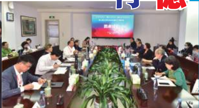
“第二屆大學遷徙歷史與文化研討會”圓桌討論環節