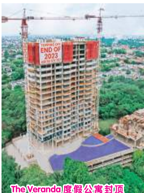
The Veranda 度假公寓封顶