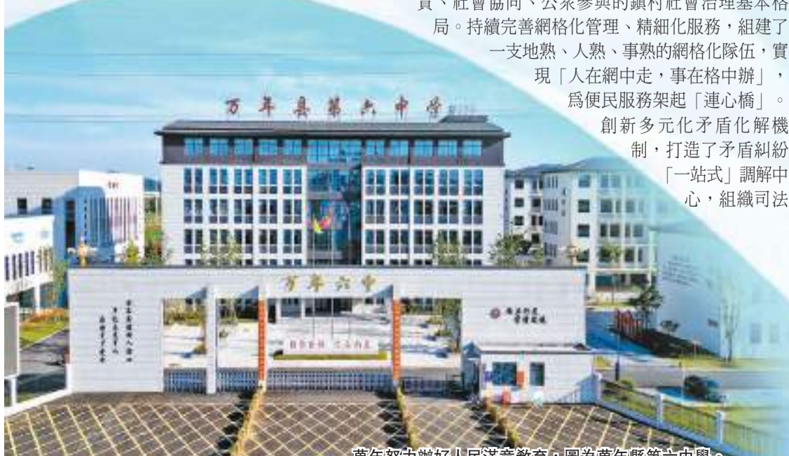
萬年努力辦好人民滿意教育，圖為萬年縣第六中學。

長坡厚雪，靜水深流，信仰有力，不忘初心。在主題教育走深走實的過程中，萬年縣立足實際，牢記「國之大者」；問計於民，緊盯「重點難點」；切入關鍵，突出「排憂解難」，緊扣時代脈搏，馳而不息、綿綿用力，用心用情履職盡責，賦能縣域發展、回應人民期待，努力在「走在前、勇爭先、善作為」中彰顯萬年擔當。