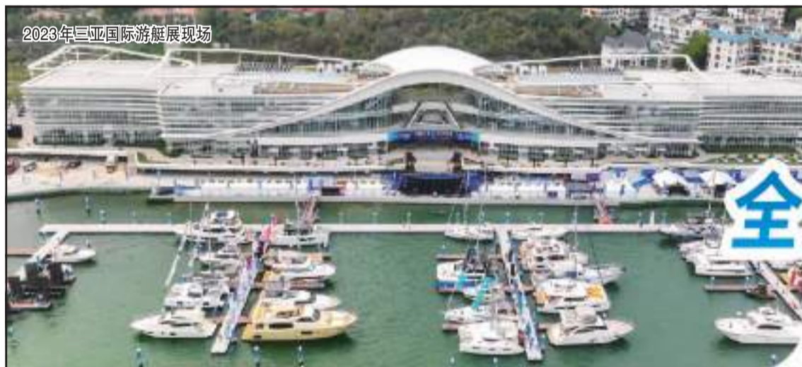
2023年三亚国际游艇展现场