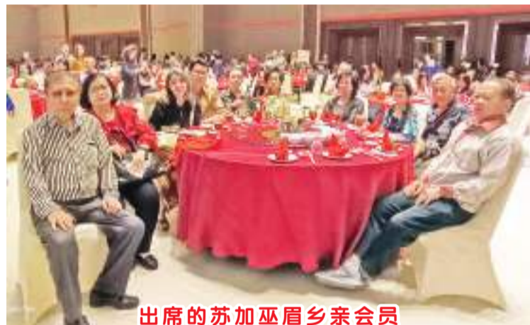
出席的苏加巫眉乡亲会员