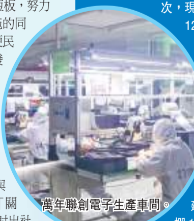
萬年聯創電子生產車間。