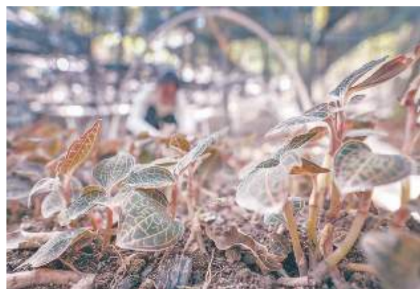
在泉州市金草生物技術有限公司金錢蓮種植基地內，金錢蓮茁壯生長。