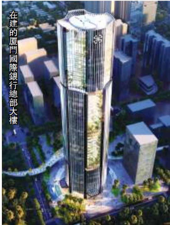
在建的廈門國際銀行總部大樓

未來，廈門國際銀行將持續推動華僑金融目標客群、服務標準、業務政策、特色產品、服務體系等的全面建設，加強全行內外聯動，延伸華僑金融服務觸角，並持續構建“優僑服、聚僑心、樹僑牌”三大體系，專注服務華僑華人、廣泛團結僑胞僑眷，共同開啟華僑金融的美好未來。