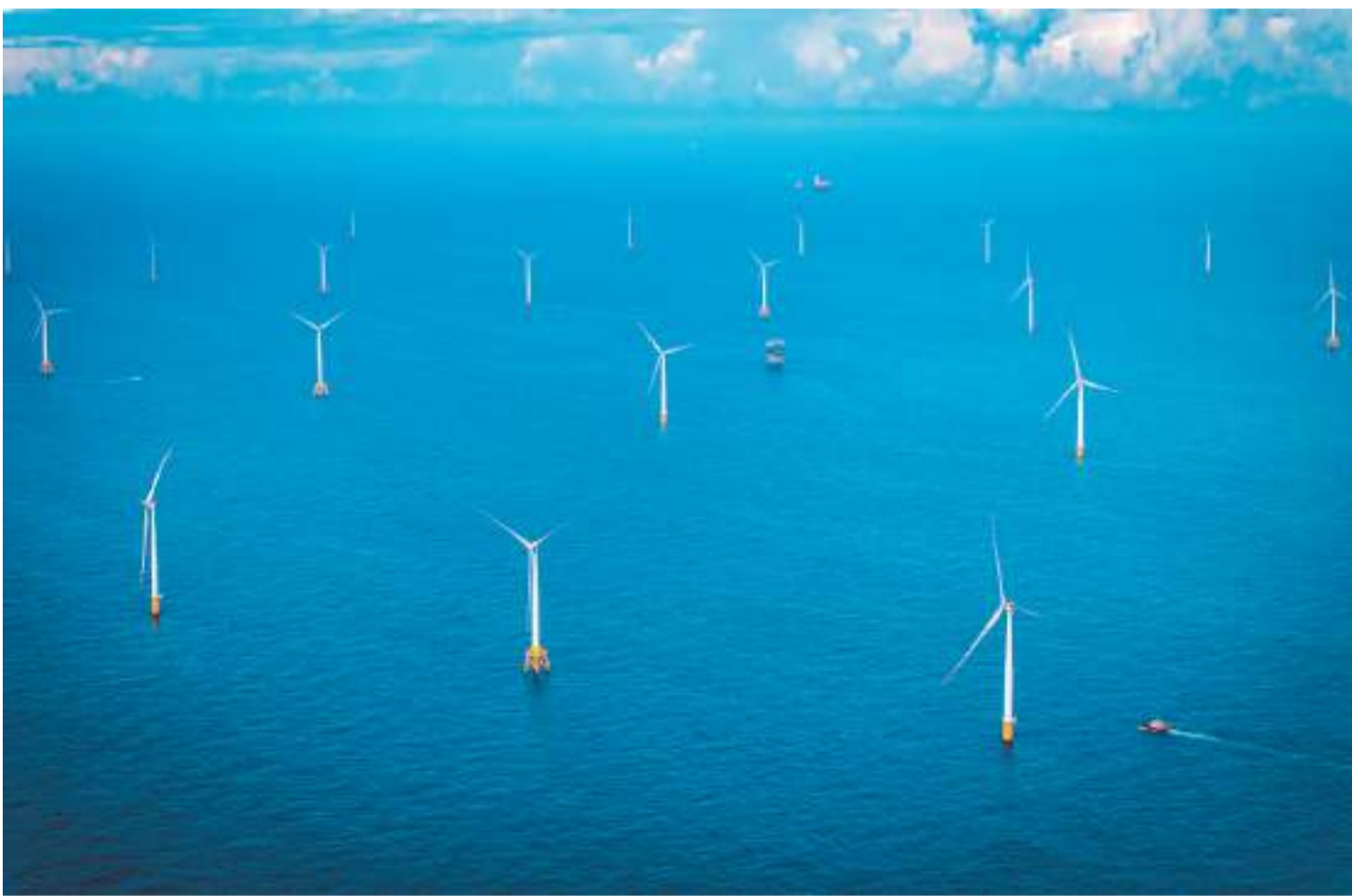
中广核惠州港口100万千瓦海上风电场近日全容量并网，年发电量约30亿千瓦时，标志着粤港澳大湾区首个百万千瓦级海上风电项目全面建成投产。中广核惠州港口100万千瓦海上风电分两期建设，共计安

为鼓励本地市民消费，旅发局将向香港市民送出20万份“香港夜享乐”本地市民版餐饮消费券，总值2000万港元，于12月20日及明年1月10日分两批推出。