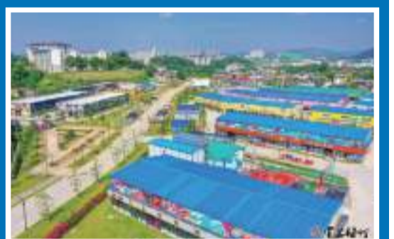
梅城百歲山腳下的梅江區青梅互聯網創業產業園成為青年創業者的“夢工廠”。