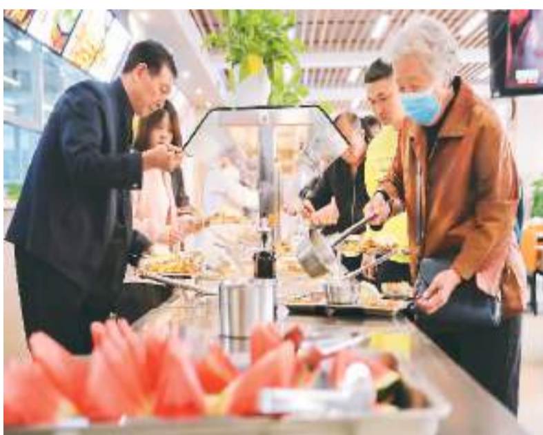
10月13日,吉林省长春新区飞跃街道三佳社区敬老餐厅内,老人正在选取午餐。

今年起,国家卫健委等相关部门部署开展全国医疗卫生机构信息互通共享三年攻坚行动。当前,国家全民健康信息平台已基本建成,省统筹区域全民健康信息平台不断完善,基本实现国家、省、市、县平台联通全覆盖。目前,已有8000多家二级以上公立医院接入区域全民健康信息平台,20个省份超80%的三级医院已接入省级全民健康信息平台,25个省份开展电子健康档案省内共享调阅,17个省份开展电子病历省内共享调阅。依托平台,各地通过办好“一件事联办”等关键小事,取得了信息便民惠民的良好效果。