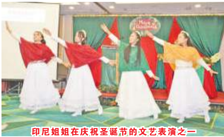
印尼姐姐在庆祝圣诞节的文艺表演之一

在今天的活动中，迎来香港2023年12月10日当选的香港议员李清霞。她关心在港印尼背景的华人，印尼女佣，菲律宾女佣的人士，在印尼华人全力支持下参选成功。在此特别祝贺李清霞议员。