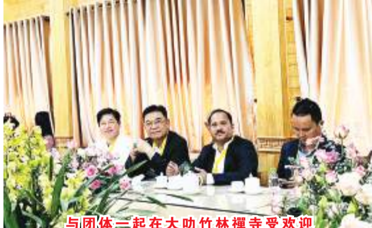
与团体一起在大叻竹林禅寺受欢迎