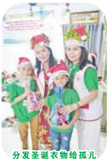
分发圣诞衣物给孤儿