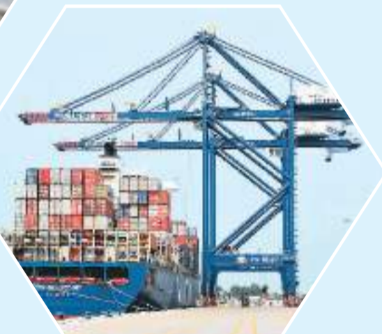
▲ 一艘满载集装箱的货轮停泊在尼日利亚莱基深水港。