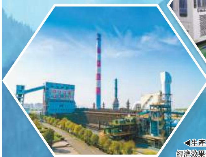
◀生產工藝全球領先、循環經濟效果突出的焦化企業。