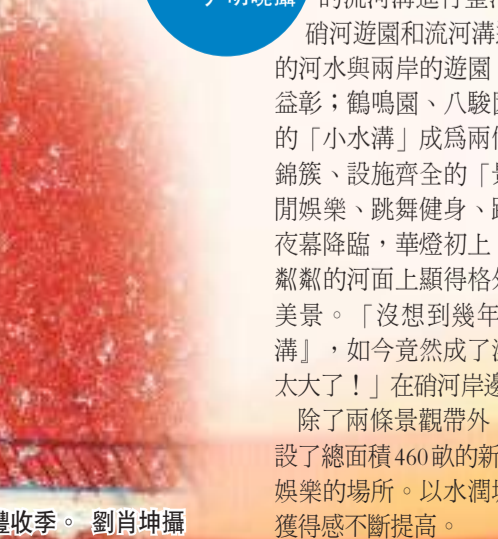
內黃辣椒迎來豐收季。