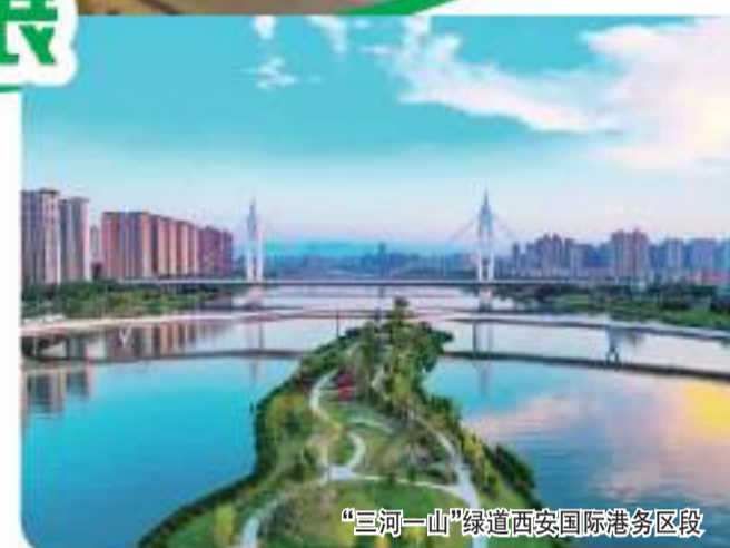
“三河一山”绿道西安国际港务区段