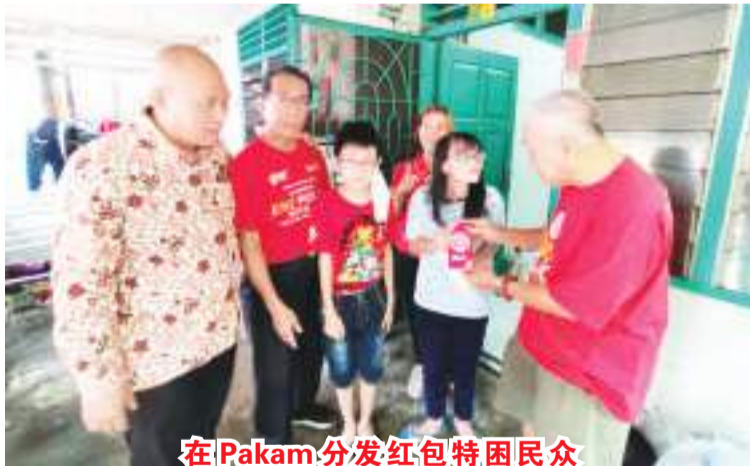
在Pakam分发红包特困民众