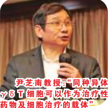
尹芝南教授：“同种异体γδT细胞可以作为治疗性药物及细胞治疗的载体”