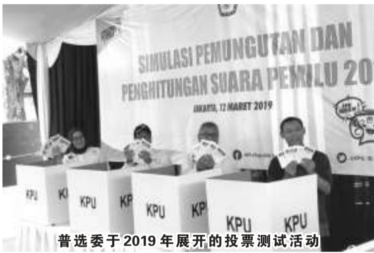
普选委于2019年展开的投票测试活动

【本报讯】每五年一次举行的选举成为一项国家议程。选举的存在是我国民主进程不可分割的一部分。在每一次发展中，选举制度都经历了非凡的动态，最终我国实施了同时进行选举的政策。2019年成为同时举行的选举开始的新历史，即总统及副总统、地方代表理事会、国会、省级地方议会和市县