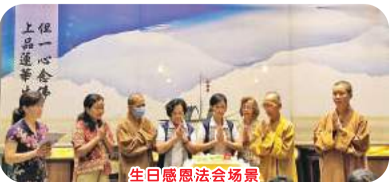
生日感恩法会场景