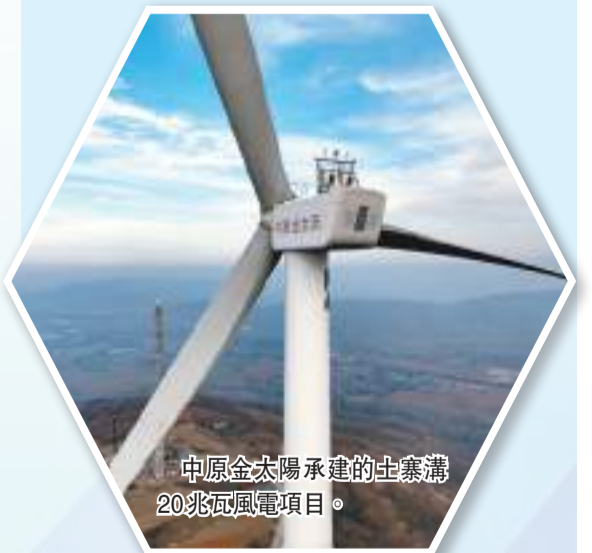
中原金太陽承建的土寨溝20兆瓦風電項目。

石墨烯導熱膜作為一種具有熱傳導性優異、高柔韌、質輕等特性的薄膜材料，已經成為5G時代終端消費電子產品、移動設備、可穿戴設備、柔性顯示屏等許多領域的關鍵材料，並越來越多的作為導熱材料應用於智能通信終端。石墨烯導熱膜新材料產業化項目，分期建設，項目一期於2022年4月開始建設，截至目前，項目已基本完成主體製漿、塗布、壓延、覆膜等工序生產設備以及配套純水、冷熱水、環評處理設備安裝調試，一期形象進度達90%。 綠色電力通常被簡稱為「綠電」，指的是利用特定發電設備從可再生能源轉化而成的電能。與傳統的化石燃料發電方式相比，綠色電力具有低碳排放的優點，能夠為減溫室效應和保護環境作出貢獻，是能源企業實現碳達峰、碳中和的必由之路。中原金太陽公司是深耕光伏等新能源產業增量市場的主要力量。據介紹，該公司因地制宜，秉持「應建盡建」原則，不斷推進光伏、風電項目裝機提質增量。今年一季度該公司在五礦、開封華瑞公司、田莊選煤廠等15處地點、二季度在力源化工公司、香山礦等6處地點開工建設的光伏電站正在陸續併網發電；聯合鹽化公司、氧鹼股份公司等光伏儲電項目已陸續併網發電。 11月26日，中國平煤神馬集團中原金太陽土寨溝20兆瓦風電項目最後一個風電機組混塔吊裝完畢，開始進入併網調試階段，標誌着新能源領域拓展迎來里程碑時刻。為讓煤礦也能用上綠電，按照中國平煤神