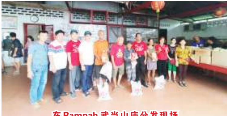
在Rampah 武当山庙分发现场