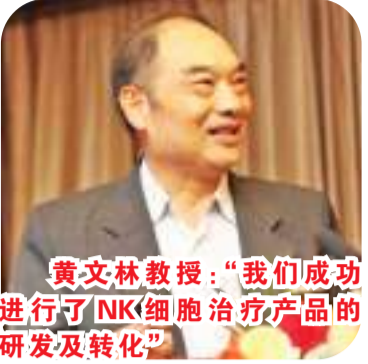
黄文林教授：“我们成功进行了NK细胞治疗产品的研发及转化”