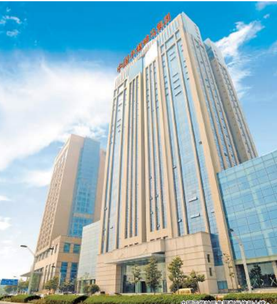
中國平煤神馬集團鄭州總部大樓。

馬集團统一部署，中原金太陽公司規劃在八礦磚廠、香山礦西井等地建設風電機組，打造「一礦一杆」項目。「一礦一杆」項目今年總裝機容量預計達50兆瓦，全部併網後每年可發1億千瓦時綠電。 面向未來，登高望遠。12月4日下午，易成新能2024年形勢研判及工作謀劃務虛會在鄭州管理中心會議室召開，群策群力謀劃推動公司高質量穩健發展大計。「面對新形勢、新征程，我們還是要堅定高質量發展信心，聚焦補齊短板、挖掘相對優勢，以進固穩、順勢而為，在高質量發展道路上勇立潮頭。」 文/許來臣