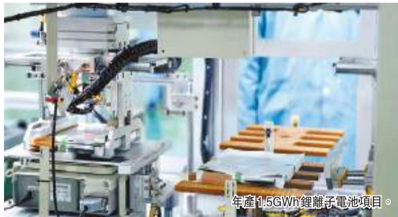
年產1.5GWh鋰離子電池項目。