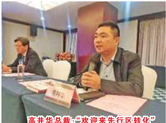
高井华总裁：“欢迎来先行区转化”