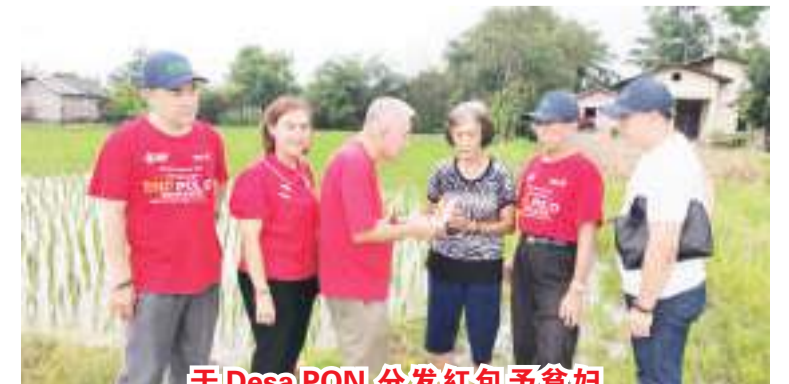
于Desa PON分发红包予贫妇