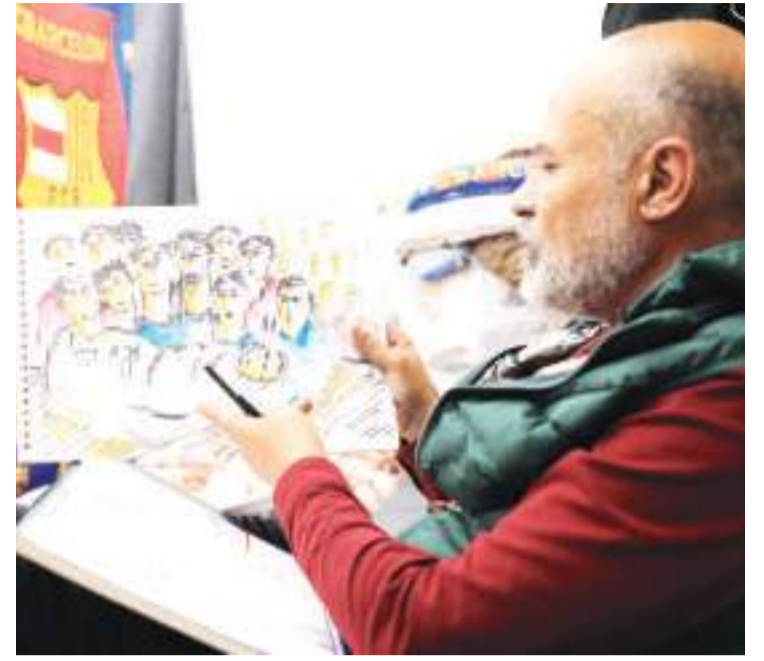
巴勒斯坦画家用绘画企盼和平

包括针对以色列机场、军事基地等发射火箭弹的时间表。据加沙地带卫生部门28日公布的统计数据,自10月7日巴以爆发新一轮军事冲突以来,以军在加沙地带的军事行动已造成超过2.1万人死亡、5.5万余人受伤。