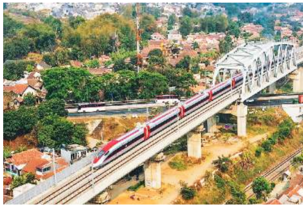
印度尼西亚帕拉朗，一列雅万高铁动车组正在行驶中。

2023年是共建“一带一路”倡议提出10周年。这一年，中国企业接续奋斗、砥砺前行，交出一份亮眼的成绩单。从中国高铁、中国路、中国港，到中国数据中心、中国电子产品……中国品牌成为推动各国互联互通、闪耀在“一带一路”的靓丽“名片”。