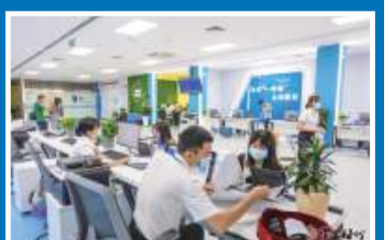
近年來,通過政務服務舉措的“微改革”“微創新”,梅州推動審批跑出“加速度”,群眾辦事越來越省事。