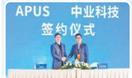
在2023河南省互聯網大會人工智能分會現場，中業科技與APUS公司簽署合作協議。

代信息技術、數據處理、人工智能相關技術與具體場景相結合。通過對語義理解、機器翻譯、人機交互三大核心技術領域的不斷深耕與錘煉，並與中業雲數據和人工智能算法的深度融合，賦予機器感知、交互和理解的能力，形成了AI+社交、AI+翻譯、AI+醫療、AI+機器人、AI+硬件等「AI+」（AI賦能）模塊，語音識別、智能翻譯、智慧交通、智慧醫療、智能製造等特色業務多元化的生態體系，讓人工智能更好地為實際生活服務，實現了從「解決人與人溝通」到「解決人與AI溝通」的創新轉變。