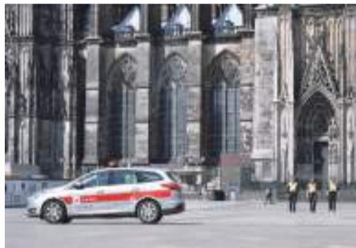
新華社北京12月26日電--歐洲多國聖誕