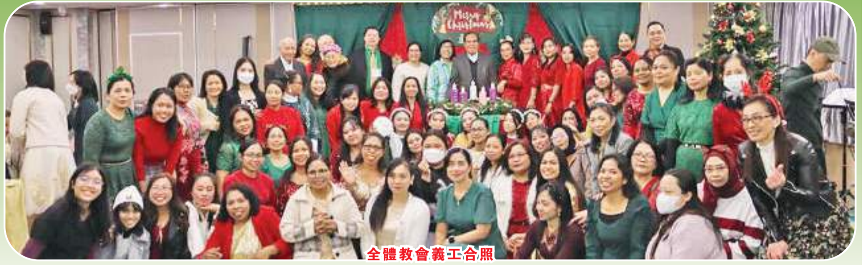
全體教會義工合照