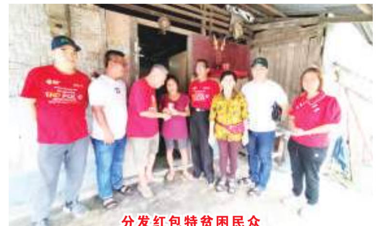
分发红包特困民众