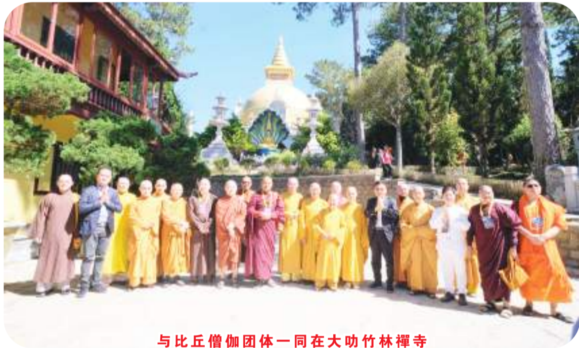
与比丘僧伽团体一同在大叻竹林禅寺