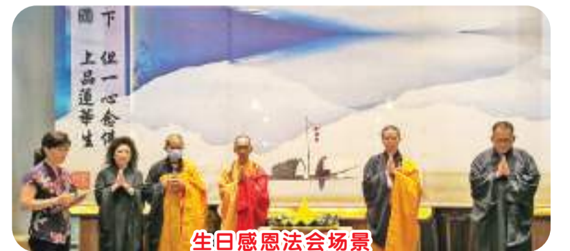
生日感恩法会场景