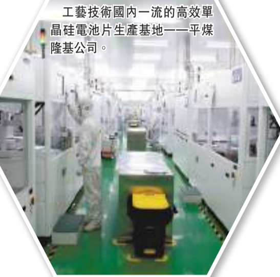
工藝技術國內一流的高效單晶硅電池片生產基地——平煤瀾基公司。

「不改革不行、改得慢不行、改得不徹底也不行」，大刀闊斧改革推進，採取一攬子針對性措施補短強弱。 堅決貫徹落實集團專精特新放權及監督並重改革、「5+2」重點項目管控改革等「2+6」體系化機制改革，加快推進中原金太陽、易成陽光、開封時代等專精特新企業高質量發展、爆發式增長。 優化調整子公司管理機制，實現易成瀾博、中平瀾博一體化運營，提升了綜合效益。同時，全面實施權力下放、重心下移，調動子公司主動發展積極性。 全面推廣「日成本、日利潤」管理法，充分發揮產業鏈協同優勢，促進產品結構優化、工藝技術提升，着力降本增效。 以正向激勵為主，探索嘗試經理層任期制和契約化管理改革，調動幹部隊伍幹事創業積極性、主動性、創造性。 …… 新常態下的市場競爭，唯改革者進，唯改革者強，唯改革者勝。改革成效全面呈現。 全面深入改革下，易成新能子公司易成瀾博緊跟市場風向，調整生產經營思路，根據客戶需求定製產品，步步為營搶佔市場。 易成陽光面對俄烏衝突對市場的衝擊，不斷開拓儲能等產品運銷新場景，另闢賽道、危中求