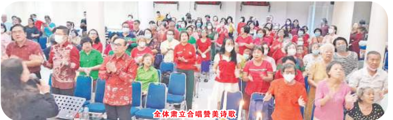
全体肃立合唱赞美诗歌

【本报讯】2023年12月24日(周五)，棉兰 Lovely Family Charity Group(LFCG)，一行人赴往 Pantj Asuhan Taman Suka Cita Anak Bangsa 与孤儿们一起庆祝圣诞节及分发圣诞礼品于孤儿们。