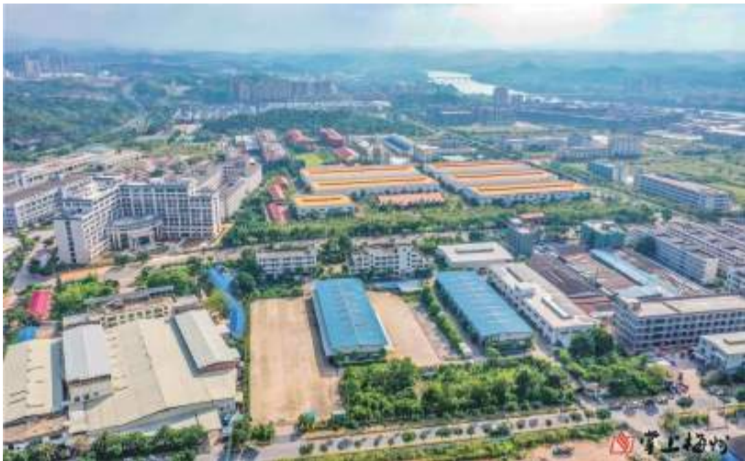
在全省率先探索開展“免費梅州”行動,通過盤活閑置資產,變“發展包袱”為“共富抓手”。梅州高新區先行先試。

改革創新,敢為人先。改革開放45年來,梅州堅持改革不停頓、開放不止步,在農村綜合改革各項工作中成為“探路者”,探索形成了一批可推廣的“梅州模式”;通過政務服務“微改革”“微創新”,梅州推動審批跑出了“加速度”……梅州,以一往無前的勇氣逢山開路、遇水架橋,以務實有力之舉推動高質量發展向更深層次挺進、向更高境界邁進。