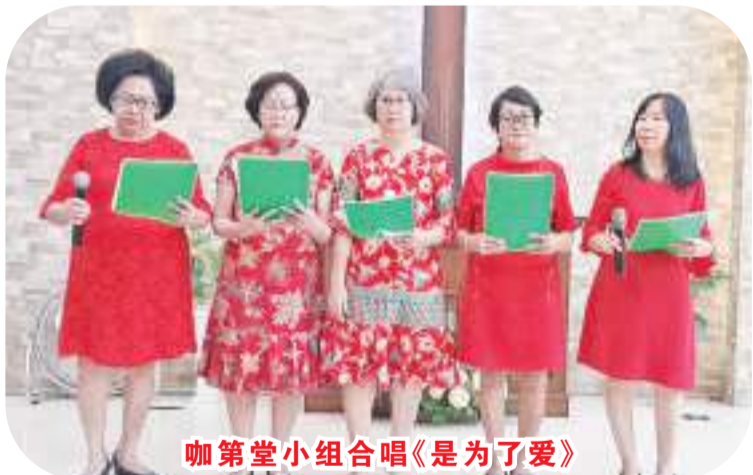
咖第堂小组合唱《是为了爱》