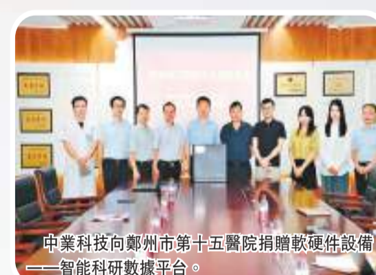
中業科技向鄭州市第十五醫院捐贈軟硬件設備——智能科研數據平台。

成模型認證五級」和公安部監製的「信息安全等級保護備案三級」證書，「基於GPU運算的高性能大規模並發精準機器識別技術」被河南省科技廳確認為科學技術成果，取得市級企業技術中心和「鄭州市自然語言處理工程技術研究中心」認定，入選「河南省上市後備企業」。 從2011年起中業科技的NLP自然語言全球翻譯社交數據庫的探索，到2023年中國版chatGPT智慧醫療和教育板塊的打造。從2023年1月份中業科技受邀參與全國信標委人工智能分委會知識圖譜工作組主辦的《知識圖譜互聯互通白皮書》編制工作，到中業科技作為核心單位參與由國家人工智能標準化總體組、全國信標委人工智能分委會指導編寫的《人工智能倫理治理標準化白皮書（2023版）》國家標準的制定，再到中業科技作為河南省唯一參與的本土企業。2023年4月14日由中國衛生信息與健康醫療大數據學會和《中國衛生信息管理雜誌》聯合舉辦的2023（17th）中國衛生信息技術/健康醫療大數據應用交流大會暨軟件與健康醫療產品展覽會（2023 CHITEC），中業科技作為一家專注於