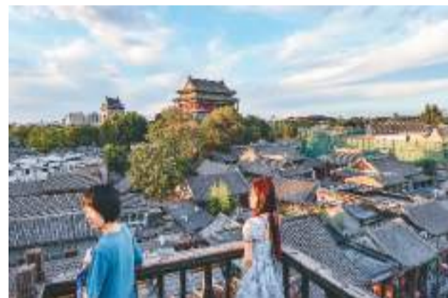
6月10日,人们在北京什刹海附近咖啡厅露台欣赏风景。

“私藏小众胡同骑行路线”“夏日晚风氛围感路线”“日行2万步路线”……社交平台上,网友们晒出的City walk方式和路线五花八门,年轻人试图用自己的方式,找寻专属的风景,解锁一座城市的不同面,在探索城市