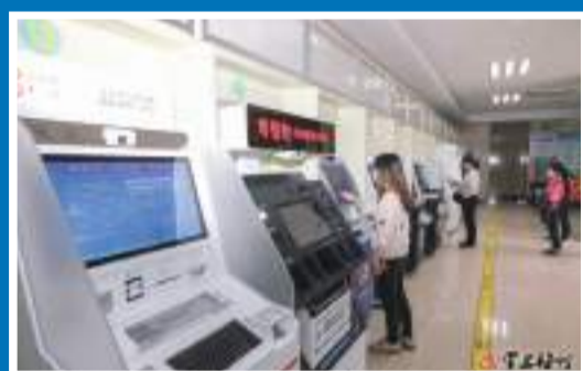
我市持續推進“指尖辦”改革,拓展“自助辦”服務,解決群眾急難愁盼問題。