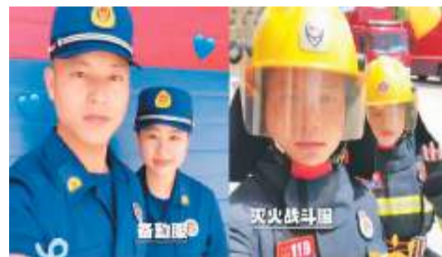
江西消防发布的“多巴胺穿搭”。

巴胺”引申出“快乐因子”的含义,从可视的色彩到不可视的抽象概念,都能用“多巴胺”来形容,如“多巴胺景区”“多巴胺漫步”“多巴胺饮食”“多巴胺休假”等。有专家分析,“多巴胺XX”