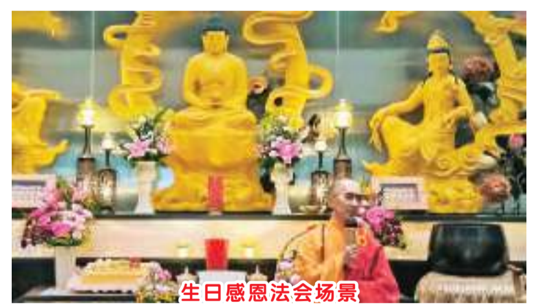
生日感恩法会场景