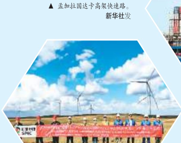
▲ 孟加拉国达卡高架快速路。