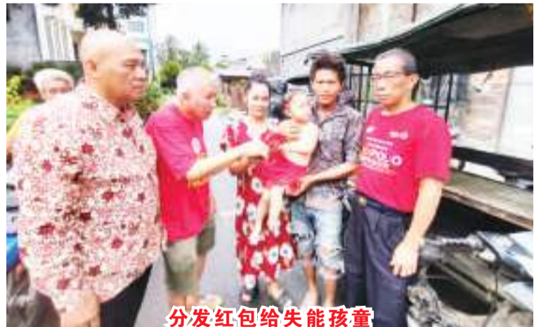
分发红包给失能孩童