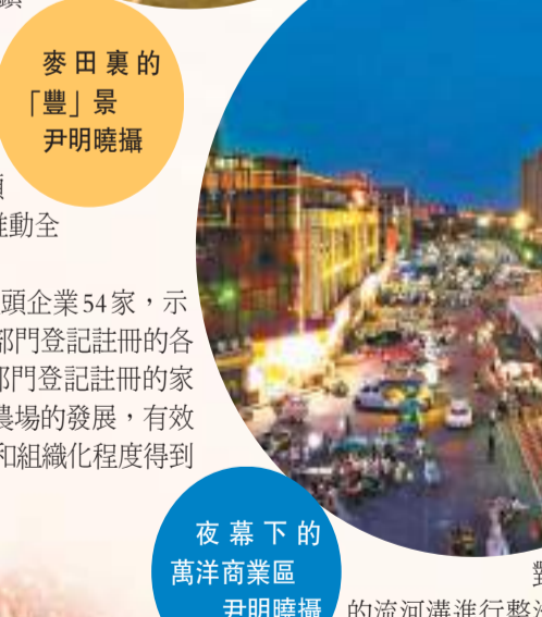
夜幕下的萬洋商業區