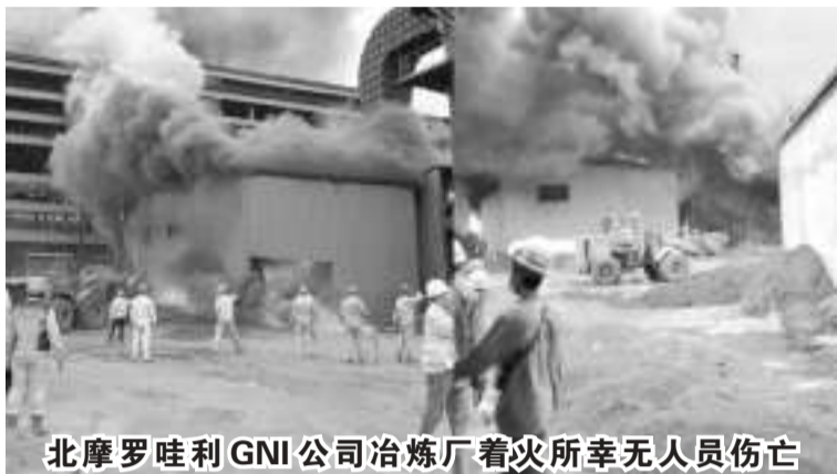
北摩罗哇利 GNI 公司冶炼厂着火所幸无人员伤亡

【本报讯】12月28日下午，中苏拉威西省(中苏省)北摩罗哇利县(Morowali Utara)一家冶炼厂 Gunbuster Nickel Industri (GNI) 公司发生火灾。火灾事件的视频在社交媒体上疯传。