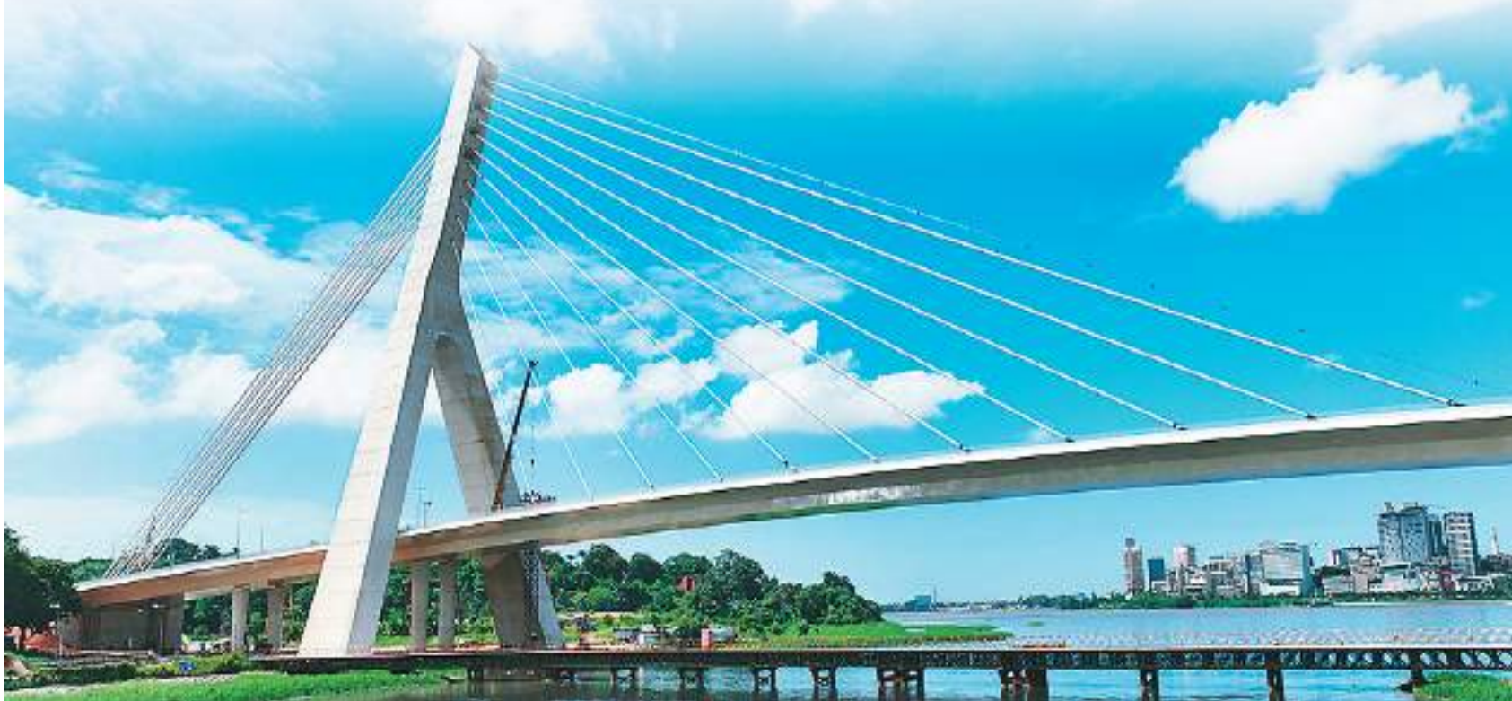
▲ 在科特迪瓦经济首都阿比让的科科迪桥。

读中国网文、看中国电视剧、听中国音乐……在共建“一带一路”国家中，中国文化越来越流行，学中文成为更多年轻人的选择。 今年以来，孔子学院在欧洲、非洲等地“开花结果”，在许多国家首次揭牌成立，满足了当地居民学习中文的需求，促进了文化交流，拉近了民众心与心的距离。“汉语桥”比赛在各国开展，各国选手不仅在比赛中讲述与中国的缘分以及对学习中文的热情，还通过舞狮、武术、舞蹈、书法、脱口秀等展示对中国文化的热爱。 在越南大街小巷，能频频听到《错位时空》《月光与朱砂痣》等在抖音平台上非常流行的歌曲，不少越南年轻人还会跟唱。更多中国网络文学作品出海，吸引大批海外读者订阅“催更”。 (本报记者 吴雪聪 赵昊整理)