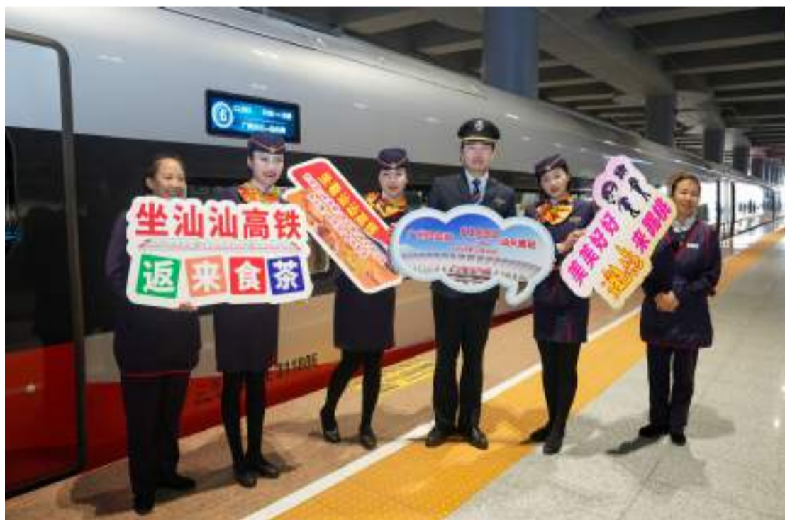
汕汕高鐵列車旁，列車員正在迎客。

廣州白雲站位於廣州市白雲區，設有3條正線、21條到達出發線，21個客運站臺面。汕汕高鐵是“八縱八橫”高速鐵路網沿海通道的重要組成部分，起自汕頭站，途經汕頭市龍湖區、濠江區、潮陽區、潮南區，揭陽市惠來縣，汕尾陸豐市、海豐縣，市城區接入廣州至汕尾高鐵汕尾站，線路全長162公里，設計時速350公里，全線共設汕頭、汕頭南、潮南、惠來、陸豐東、陸豐南、汕尾7座車站，其中汕頭、汕尾站為既有車站，其他為新建車站。本次開通運營的是汕頭南至汕尾段，線路長度142公里；汕頭至汕頭南段的控制性工程汕頭灣海底隧道工程正在