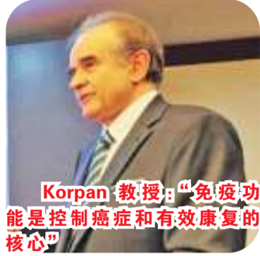
Korpan 教授：“免疫功能是控制癌症和有效康复的核心”