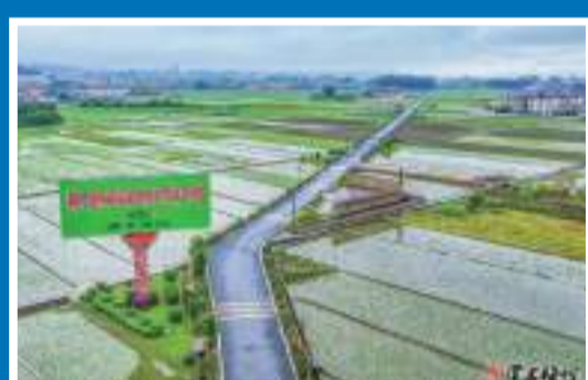
2013年4月,蕉嶺被國務院綜改辦定為全國農村綜合改革示範試點縣,成為全省首個全縣範圍內基本完成農村土地確權頒證的縣。