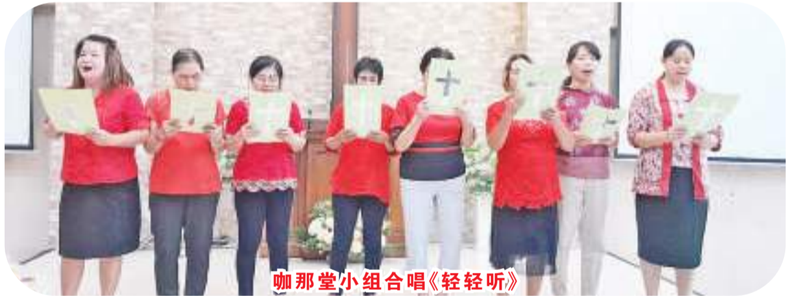
咖那堂小组合唱《轻轻听》