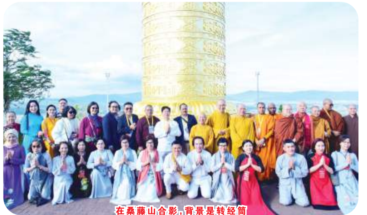
在桑藤山合影，背景是转经筒