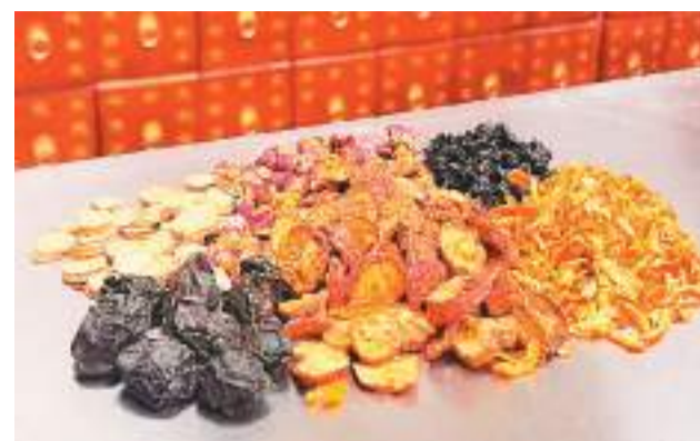
北京中医医院药学部药师根据酸梅汤配方抓取的中药茶饮。

其实,酸梅汤是中国传统的消暑饮料。中药版酸梅汤的“翻红”,反映出年轻人对中医药的认同、信赖和对健康生活的向往。中医药学包含着中华民族几千年的健康养生理念及其实践经验,是中华文明的瑰宝,凝