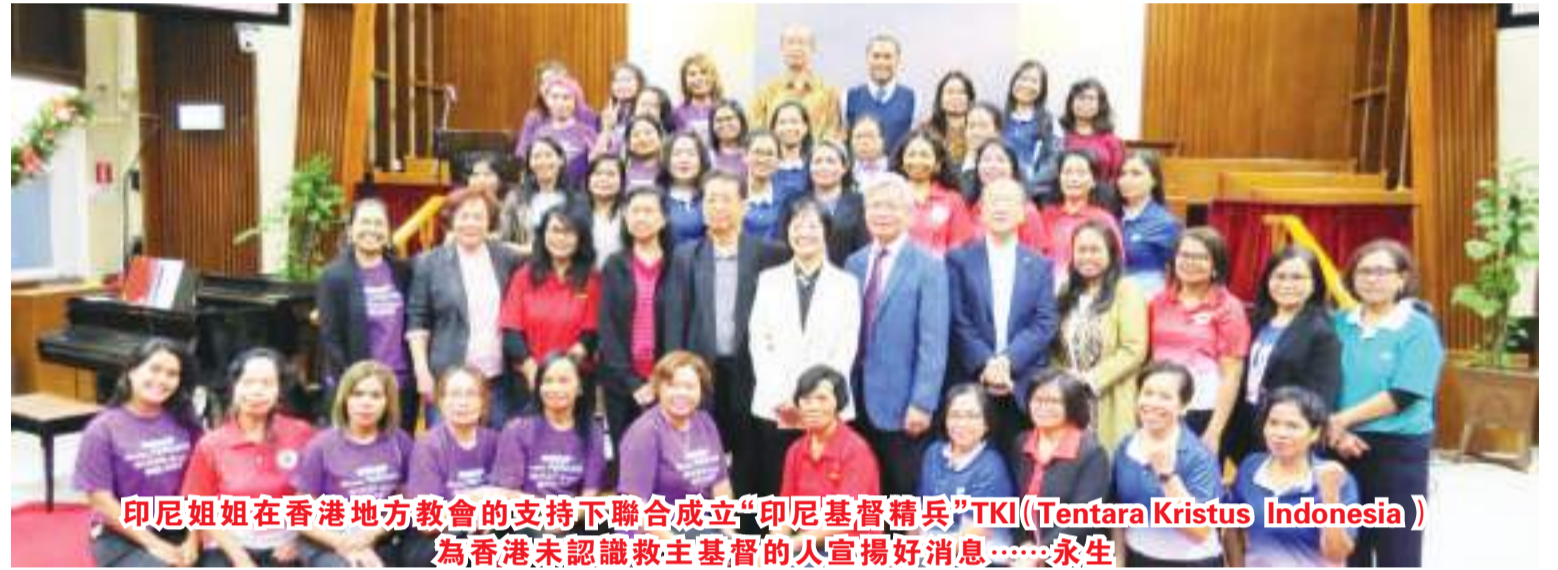
印尼姐姐在香港地方教會的支持下聯合成立“印尼基督精兵”TKI (Tentara Kristus Indonesia) 為香港未認識教主基督的人宣揚好消息……永生