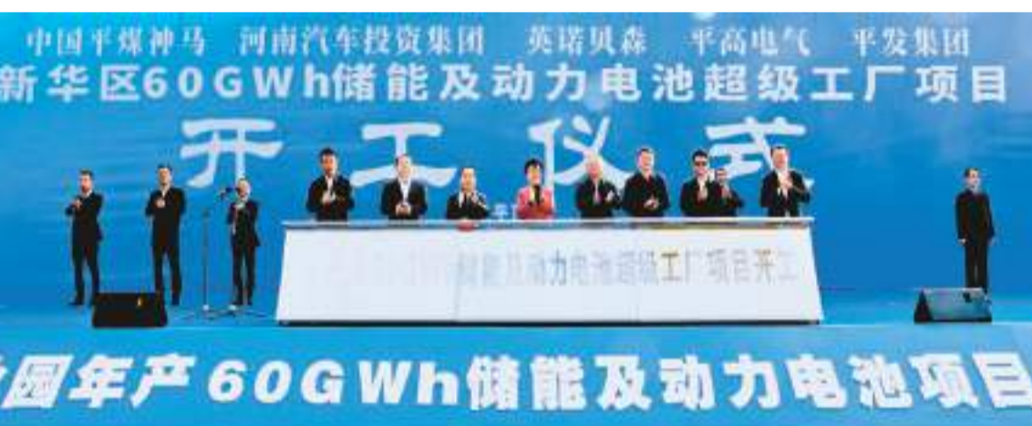
中國平煤神馬 河南汽車投資集團 英諾貝森 平高電氣 平發集團 新華區60GWh儲能及動力電池超級工廠項目 開工儀式

近年來，中國平煤神馬集團聚焦「集團做強、板塊做實、基層做優」戰略，秉承「合規、賦能、協同」上市公司運營理念，以「融、投、管、退」資本全生命周期管理為主線，通過直接融資、上市培育、投資創利、併購重組等途徑，加快資產資本化、資本證券化，推動資本和實業雙輪驅動、兩翼共振。