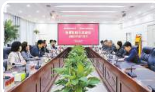
中業科技與河南省通信工程局有限公司簽約儀式現場。