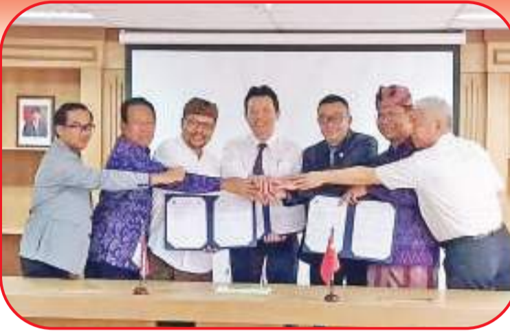
亚经协医药委、天中医第一附院、乌达雅纳大学三方签署合作协议