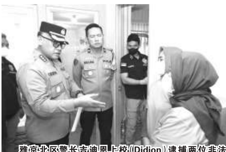
雅京北区警长吉迪恩上校(Didion)逮捕两位非法堕胎嫌疑人D和OIS。

【本报讯】进行非法堕胎嫌疑人D(49岁)和OIS(42岁)没有执业医学背景，却在雅加达北区椰风新城的一间公寓里进行非法堕胎行为。D扮演的是没有医学教育背景的医生，教育程度高中。