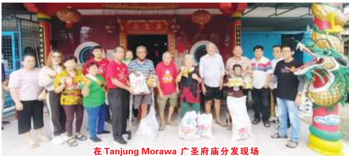
在Tanjung Morawa 广圣府庙分发现场