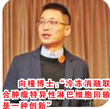
向撞博士：“冷冻消融联合肿瘤特异性淋巴细胞回输是一种创新”