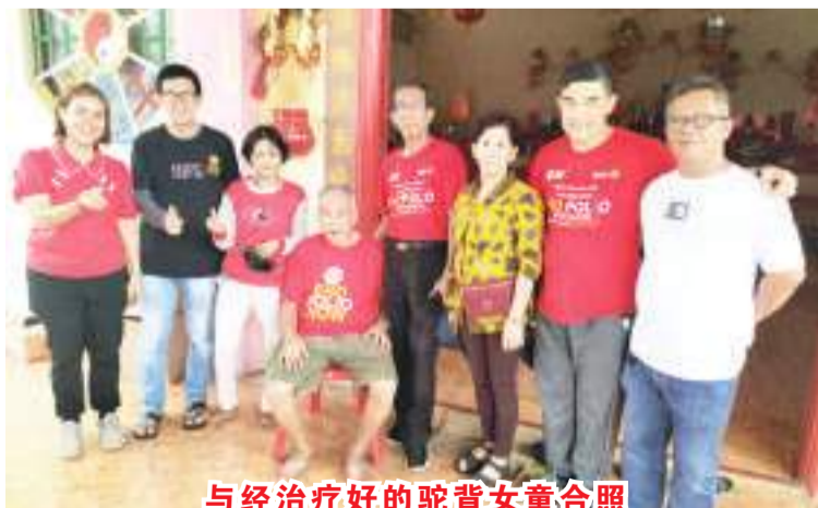
与经治疗好的驼背女童合照