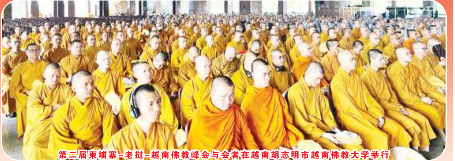
第三届柬埔寨-老挝-越南佛教峰会与会者在越南胡志明市越南佛教大学举行

【本报讯】由越南佛教僧团在越南胡志明市越南佛教大学举办的第二届柬埔寨-老挝-越南佛教峰会，于周一(25/12/2023)和周二(26/12/2023)举行。