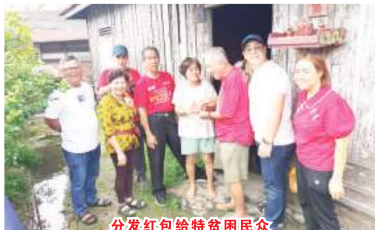
分发红包给特困民众