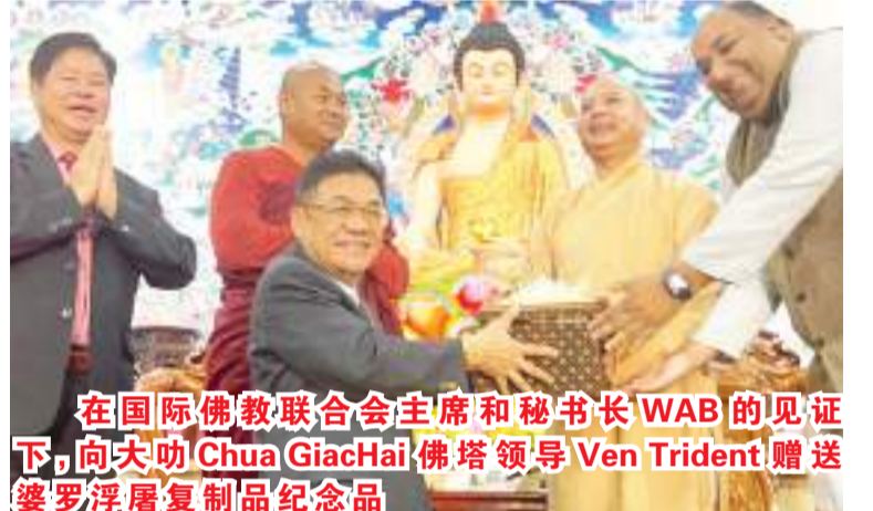
在国际佛教联合会主席和秘书长WAB的见证下，向大叻Chua GiacHai佛塔领导Ven Trident赠送婆罗浮屠复制品纪念品