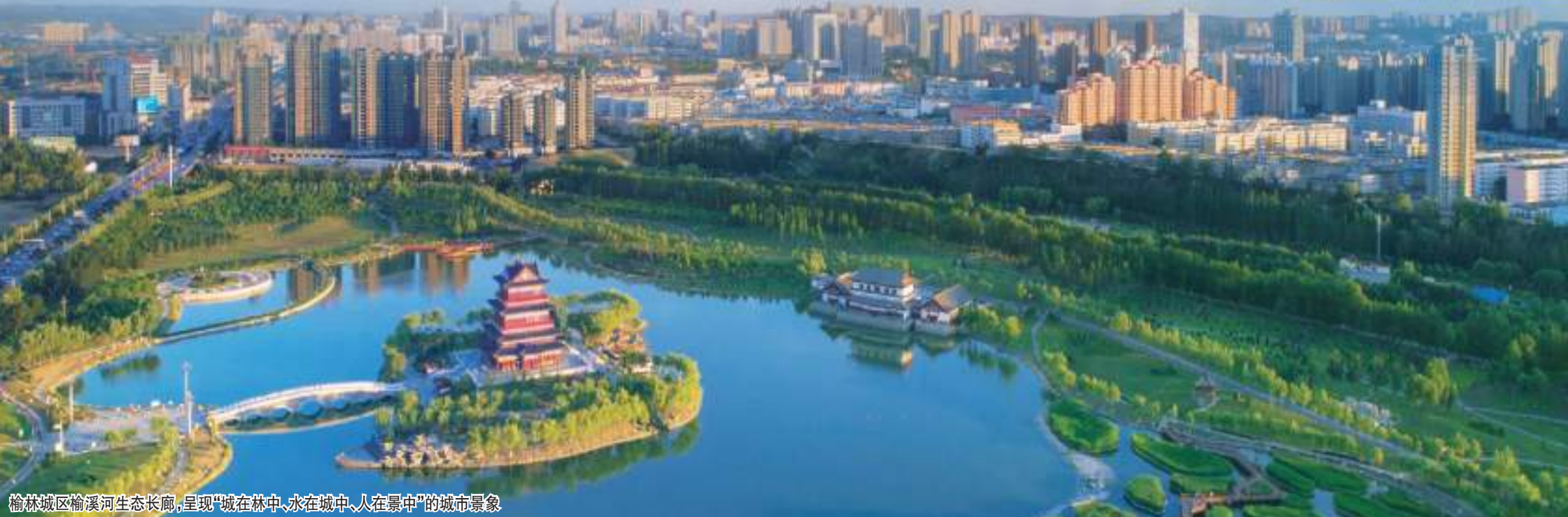
榆林城区榆溪河生态长廊，呈现“城在林中、水在城中、人在景中”的城市景象