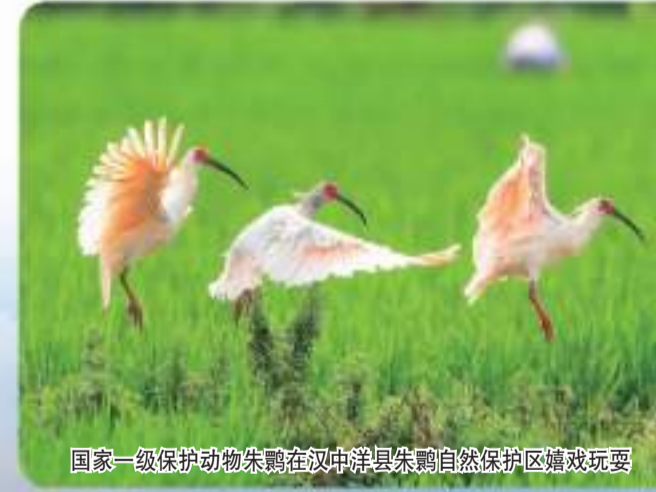
国家一级保护动物朱鹮在汉中南洋县朱鹮自然保护区嬉戏玩耍