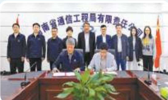
中業科技與河南省通信工程局有限公司簽署《智能醫院生態建設戰略合作協議》。