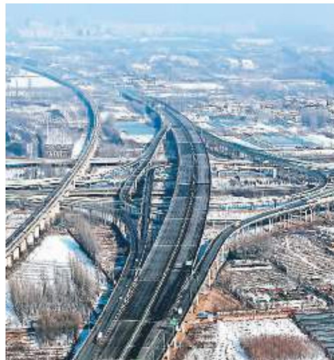
图为京雄高速北京段。

北京交通委有关负责人表示,京雄高速与京港澳高速、大广高速共同形成便捷顺畅、功能互补的区域高速公路网,强化了北京与雄安新区的交通联系,为京津冀协同发展提供了更好的交通服务保障。