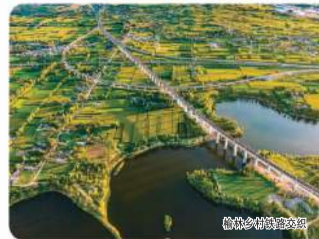
榆林乡村铁路交织