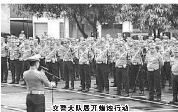
交警大队展开蜡烛行动

主要事故案件，涉及国警10起案件，国军成员5起案件，外国公民4起案件和1起普通事故。(亮剑)