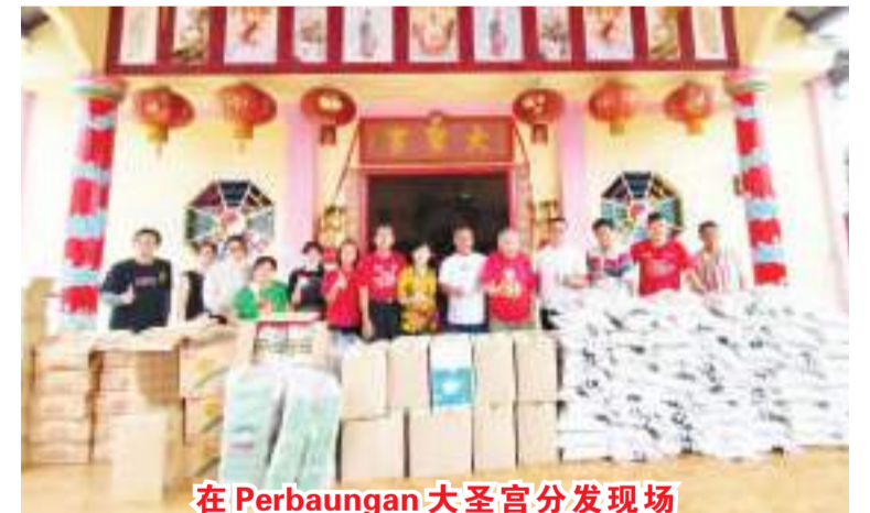
在Perbaungan 大圣宫分发现场