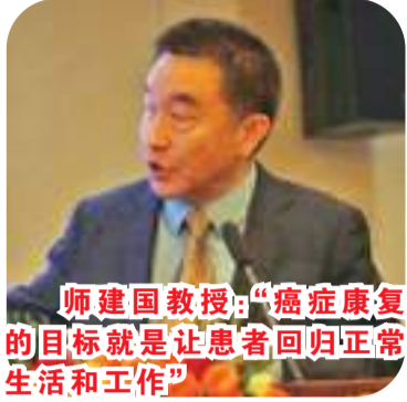
师建国教授：“癌症康复的目标就是让患者回归正常生活和工作”