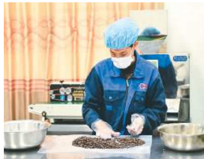
海南省琼中黎族苗族自治县不断探索垦地融合发展新路径，以“企业+村集体+农户”发展模式，整合乡村优势资源，在黎母山镇发展柑橘产业园、咖啡标准化种植示范基地等特色产业集群，促进乡村农旅融合高质量发展，助力农民增收。图为1月9日，工人在位于黎母山镇的海南农垦母山咖啡有限公司筛选咖啡豆。

年以来，宁夏持续深入打好污染防治攻坚战，整治入黄排污口946个，农村生活污水治理率达到35.65%，渝人入选美丽河湖优秀案例。为从根子上减少污染排放，宁夏深入推进排污权改革，严格生态环境准入管理，审批“两高”项目同比下降60%。