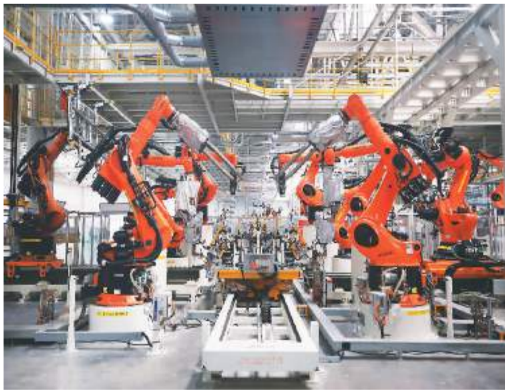
图为在安徽合肥拍摄的大众安徽模块化电驱动平台工厂车身车间一角。

(据新华社电 执笔记者邓茜 参与记者许嘉桐、周思雨、康逸、单玮怡、钟雅、吴晓凌、刘芳、熊茂伶、刘亚南)