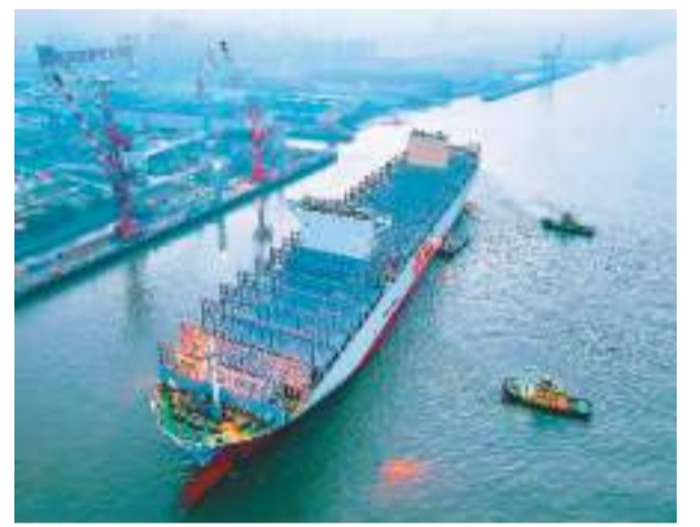
1月9日，由江苏南通中远海运川崎船舶工程有限公司自主设计制造的全球最大集装箱新造集装箱船“中远川崎396”启航，顺利离开长江南通段驶往东海北部海域。该船长399.99米，型宽61.3米，一次可装载24188只标准集装箱。

王毅表示，中央外事工作会议对今后一个时期的对外工作作出全面部署。2024年，我们将紧紧围绕推动构建人类命运共同体，全面服务中国式现代化，守正创新，胸怀大局，不断开创中国特色大国外交新局面。始终坚持自信自立、开放包容、公道正义、合作共赢，在以习近平同志为核心的党中央领导下，同各国一道，推动世界走向更加美好、光明的未来。