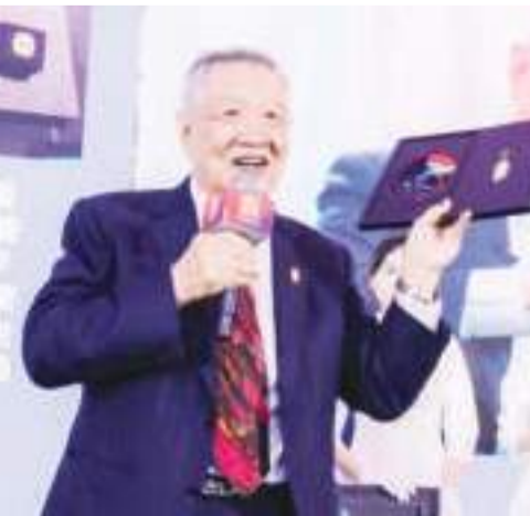
李昌钰博士捐出签名小说、警徽、签名DVD等一套纪念物品,助力慈善拍卖。

在慈善晚会上,上海市侨联副主席、秘书长陶勇为积极参与甘肃抗震救灾企业及团队颁发爱心证书,上海市侨联青年总会、英国上海商会、致公党上海市委致公爱心基金专项等代表上台领奖。