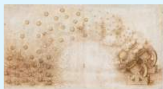
◆素描《發射炸彈的大炮》是《大西洋古抄本》中最著名的手稿之一。

此外，配合「對話達·芬奇——文藝復興與東方美學藝術特展」舉辦，上博文創以「東西方藝術的對話與融合」為基本開發理念，圍繞《頭髮飄逸的女子》《男孩與羔羊》《秋風紈扇圖》等展品進行再創作，並從「科技藝術」的概念切入，尋求差異化設計與視覺衝擊力，推出200餘種文創產品，包括馬克杯盲盒、冰箱貼、書型抱枕、千頁加密手稿、鏡像杯、紀念票根、手提宮燈、團扇等。