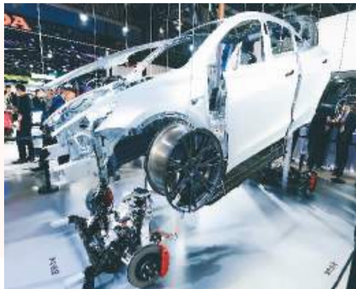
第六届中国国际进口博览会汽车展区，特斯拉携全系车型、充电和能源产品以及人形机器人“亮相”。

新年伊始，不少跨国企业开启年度规划，有意继续加大对中国市场的投入。面对变乱交织的世界和复苏乏力的全球经济，中国市场对于跨国企业而言依然充满潜力、魅力和魔力。众多跨国企业期待持续借助中国超大市场实现更大发展。