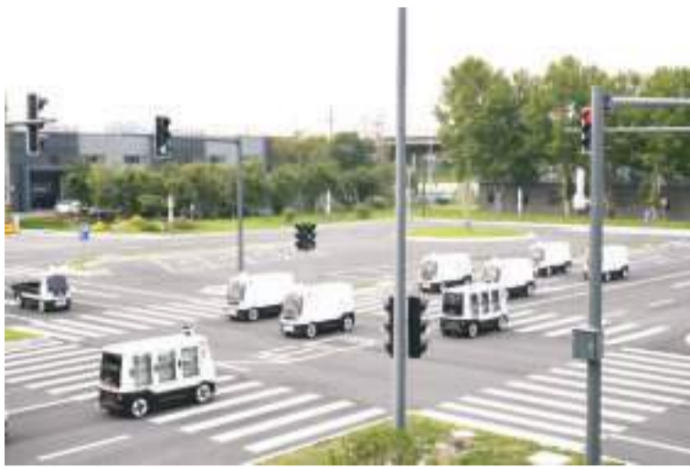
“双11”购物节中国无人快递技术崭露头角。