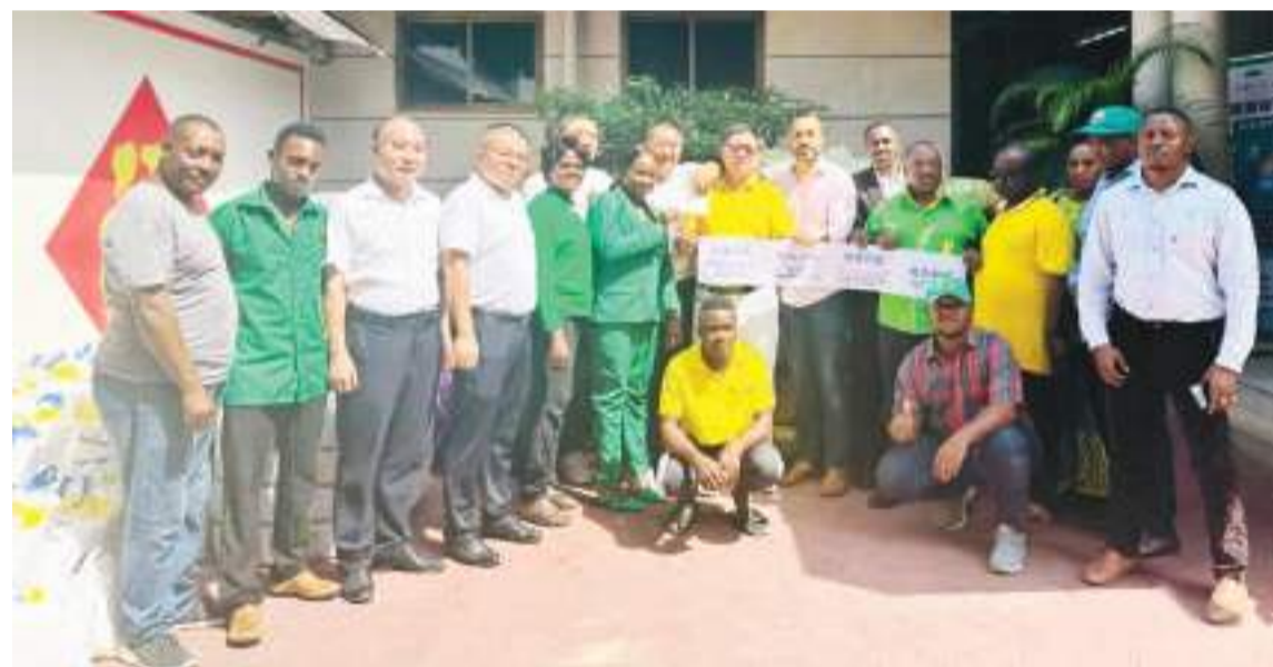
日前,坦桑尼亚中华总商会向当地洪灾灾民捐赠救灾物资。

现代农业领域,他还在当地捐建了卫生所,每年资助一些安哥拉青年学生到中国参加农业技术培训。他说:“我们希望通过不同的方式回馈当地社会、传播正能量,为当地的慈善事业、也为两国友好尽绵薄之力。”