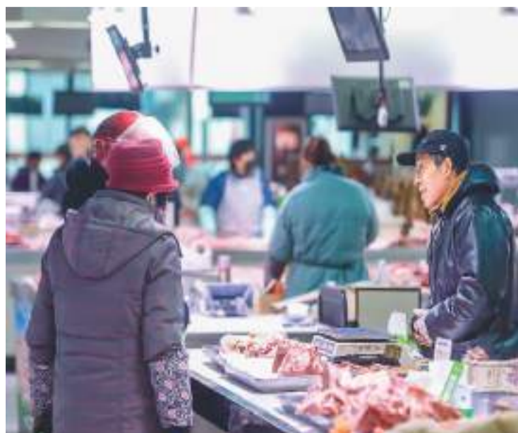
在江苏宿迁市区西楚农贸市场，市民选购肉类产品。

禁用“生鲜灯”之后，什么样的照明设施是符合要求的？《建筑照明设计标准》中规定了商店、超市、农贸市场等各类公共建筑的照明标准值（具体指标包括照度标准值、统一眩光值、一般照明照度均匀度和显色指数），可以作为商超、超市、集中交易市场、生鲜门店等食用农产品经营场所设置照明灯具的参考依据。许多地方还结合本地实际，采取多种形式进一步细化食用农产品经营场所照明等设施监管要求。