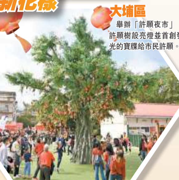
大埔區 舉辦「許願夜市」，許願樹設亮燈並首創發光的寶牒給市民許願。