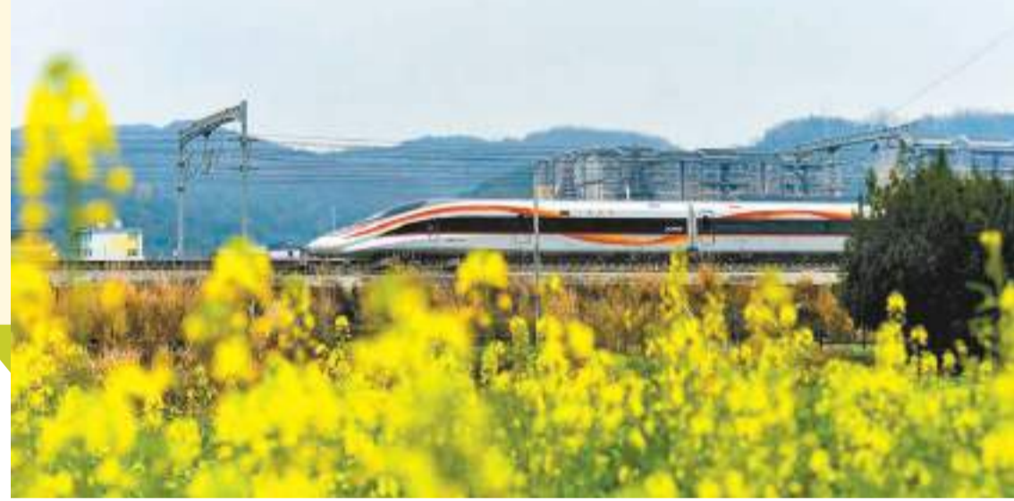
1月10日零時起，全國鐵路實行新列車運行圖，圖為一列動車組列車在貴州省從江縣境內行駛。

【香港商報訊】 綜合消息，1月9日，中國國家鐵路集團有限公司工作會議在北京召開。會議指出，國鐵集團圓滿完成了去年全年各項目標任務，推動鐵路高質量發展取得顯著成效。截至2023年底，中國鐵路營業里程達到15.9萬公里，其中高鐵達到4.5萬公里。