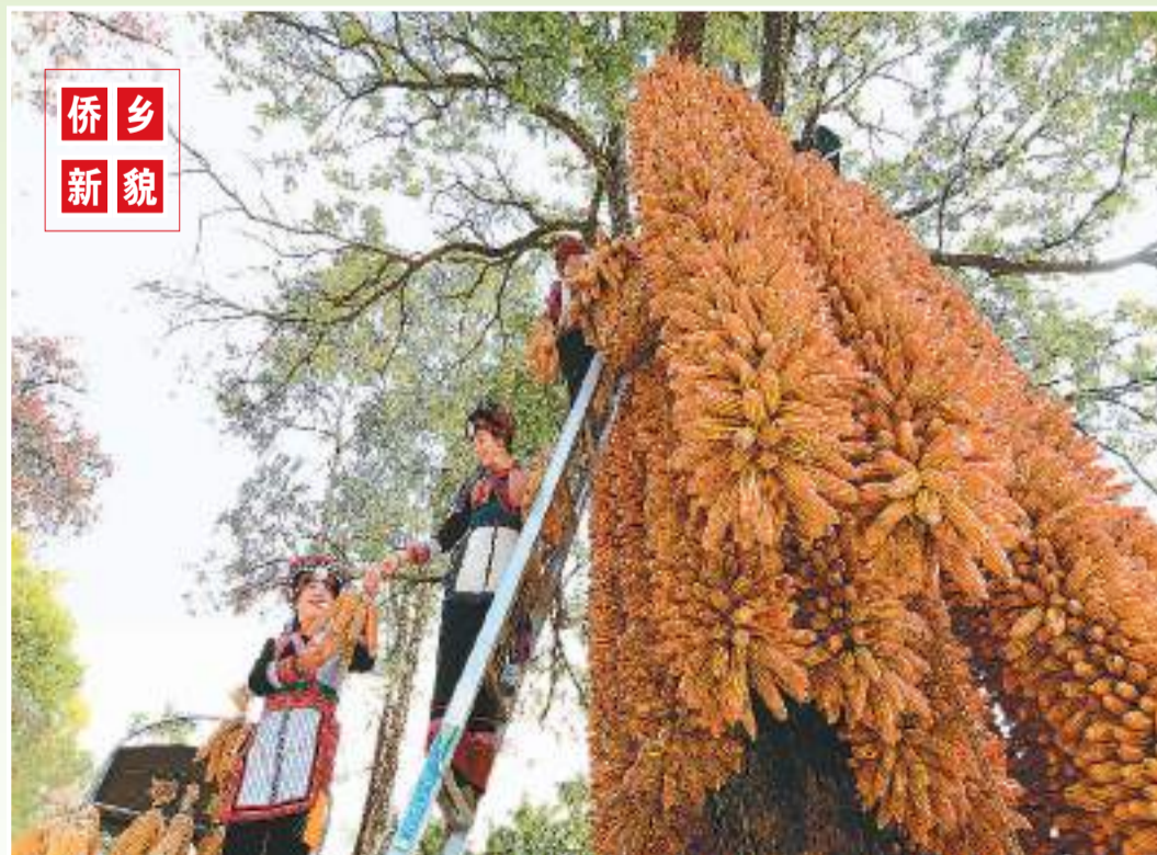
近日，云南省弥勒市西三镇马龙社区彝族群众忙着晾晒丰收的玉米，“丰景”如画。群众把玉米晾晒在室外，通风透气易干易储。晾晒玉米