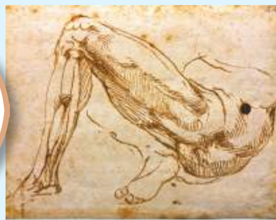
◆米開朗基羅創作的人體素描《腿》

上海博物館人民廣場館舍於近日再次重啟，舉辦「對話達·芬奇——文藝復興與東方美學藝術特展」。今次為上海博物館首推東西方繪畫藝術對話原創大展，也是內地迄今為止最強陣容的達·芬奇作品真跡展，涵蓋《大西洋古抄本》珍貴手稿在內的多件達·芬奇真跡首度亮相中國。展覽將持續至2024年4月14日。