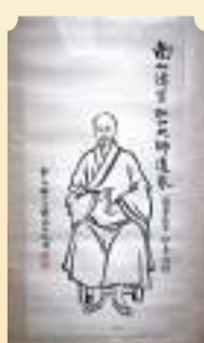
◆豐子愷中國畫《弘一法師像》