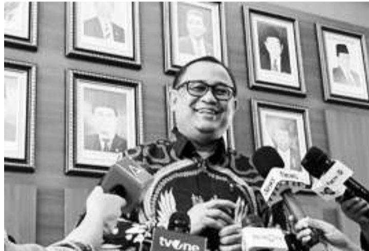
总统特别专员协调员阿里·德维帕亚纳 (Ali Dwi Pipayana)

【本报讯】1月9日，总统特别专员协调员阿里·德维帕亚纳 (Ali Dwi Pipayana) 申明，佐科维总统与印尼斗争民主党