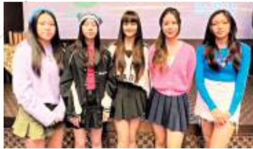
◆XiX笑言希望過年有得食年糕。

不過小朋友始終貪食,5位小妹妹最興奮的還是講到「食」。提到農曆新年在即,仍在求學的她們會否希望快些收爐慶賀新禧?她們乖巧稱,會聽從經理人的安排,有工作會照做,唱歌、跳舞和減肥都會繼續;又忍不住說:「但都會慶祝,並且一定會食年糕。」問到有否被叮囑新年也不能放縱吃年糕,因要身材管理,長期控制飲食;原本一臉期待的她們秒速變成認真地思考,繼而你一言我一語商討:「我哋會識得控制自己,又唔會講到唔食,或者食一個手指尾指尖般大小的分量,又或者我們5人分享一塊年糕,食完再狂做運動,因為我們要身體健康,龍馬精神……」為求過年有得食年糕,她們竟扯到新年賀語,相當可愛。