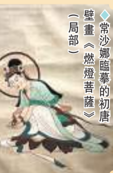
◆常沙娜臨摹的初唐壁畫《燃燈菩薩》(局部)