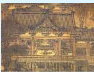
◆五代 佚名《開口盤車圖》

等藝術理論與實踐方面，各自都探索出了不同的路徑。而在意大利駐滬總領事館官員、意方策展人達仁利看來，得益於上海博物館豐富的館藏，才能夠想像、勾勒並完成意大利文藝復興與天才達·芬奇與同時代的中國傳統及藝術傑作之間的對話。