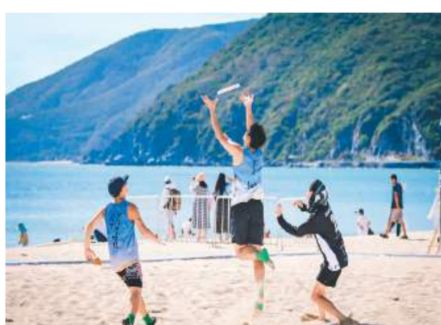
参赛选手在2023年中国沙滩飞盘公开赛（海南三亚站）比赛中。