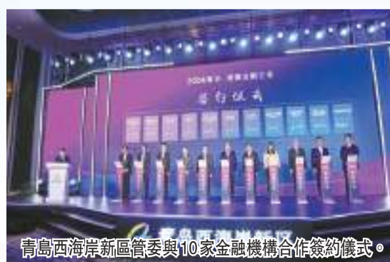
青島西海岸新區管委與10家金融機構合作簽約儀式。

助力境內企業「走出去」發展，推動境外資源「引進來」，打造青島與港澳金融合作平台。 與此同時，青島西海岸新區管委還與國家開發銀行以及五大國有商業銀行青島市分行合作簽約，聚焦服務實體經濟暢通融資渠道，推動銀行圍繞重大項目、重點領域、科技創新、民生發展、民營小微、支持國有企業發展等方面全力擴大信貸投放，打造區域金融戰略同盟。此外，青島經濟技術開發區投資控股集團有限公司與3家港澳金融機構合作簽約，拓寬國有企業融資發展新路徑。 據悉，青島西海岸新區與港澳產業互補性強，合作領域不斷拓展，港澳已經成為新區重要的對外貿易合作夥伴和重要外資來源地。西海岸新區高標準規劃建設唐島灣金融創區，深入推動各類金融業