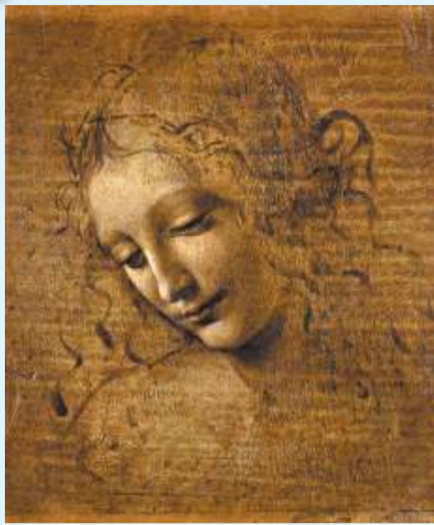
◆達·芬奇筆下最具神秘感的油畫真跡《頭髮飄逸的女子》