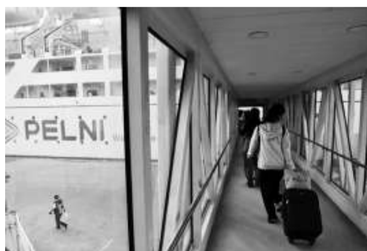
肃贪委调查印尼航运公司所涉及航运保险贪腐案。

【本报讯】肃贪委在国企印尼国营航运公司 (Pelni) 进行了一项与贪腐保险有关的新调查。肃贪委表示，此案涉及在2015-2020财年支付航运保险佣金的商品和服务采购中贿赂行为。