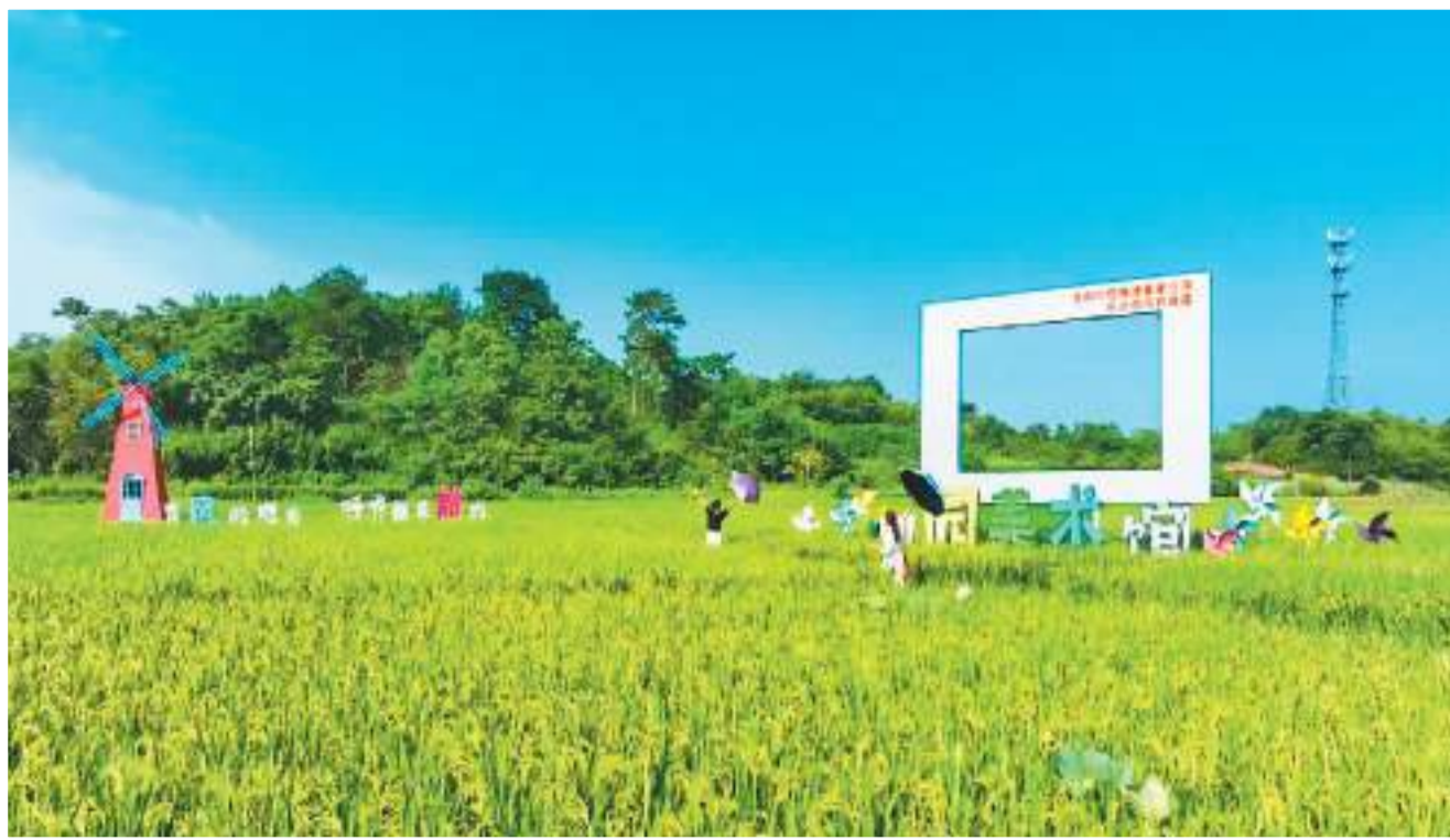
图为盛夏时分游客在槐塘村的稻田里拍照。