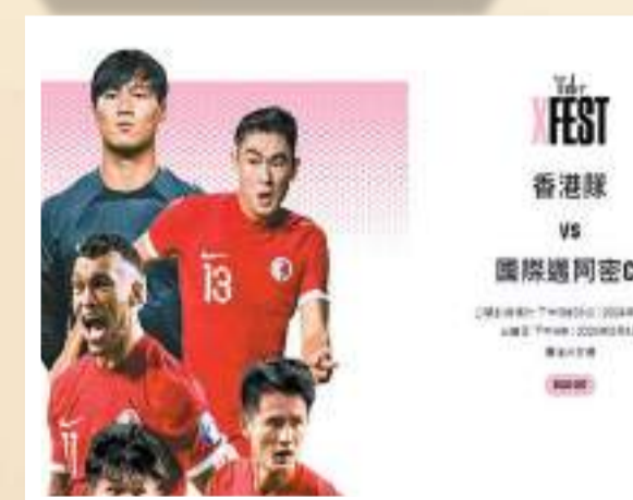
國際邁亞密2月4日來港於香港大球場友賽香港隊，美斯將會亮相。