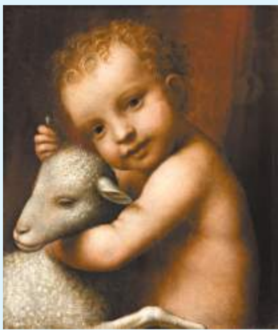
◆《男孩與羔羊》被公認為達·芬奇學生盧伊尼的傑作之一。

素描《發射炸彈的大炮》是《大西洋古抄本》中最著名的手稿之一，描繪了兩門正在發射的火炮，它創作於達·芬奇初到米蘭時期。在寫給盧多維科·斯福爾扎大公的信中，他提到：「我還能設計易操作、易攜帶的火炮，可以像風暴一樣射出碎石。它產生的濃煙能讓人感到恐懼，造成嚴重的傷害並且陷入混亂之中。」然而實際上，這件武器裝置不僅能夠射出「碎石」，還能發射由火藥、釘子或其他金屬裝填的榴彈，並且