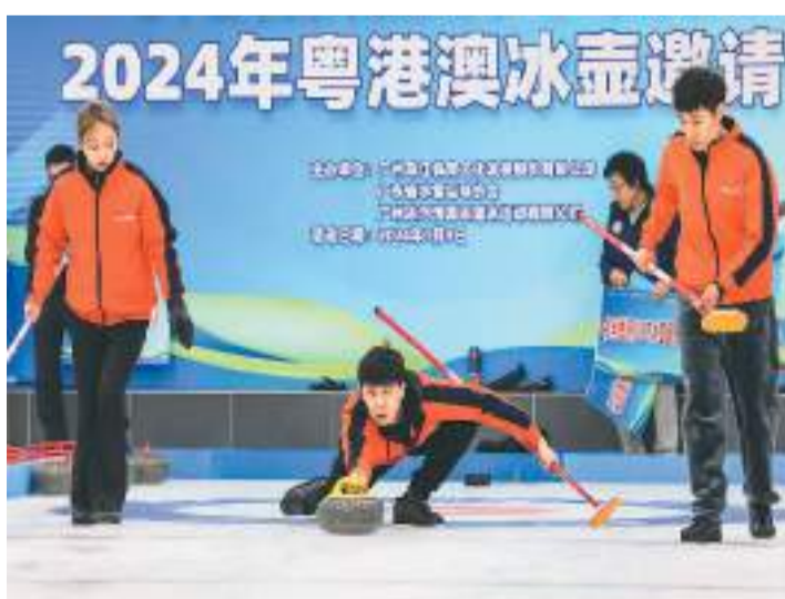
1月9日,2024年粤港澳冰壶邀请赛在广州珠江环世冰壶馆举行。图为珠江环世冰壶队选手在比赛中掷壶。