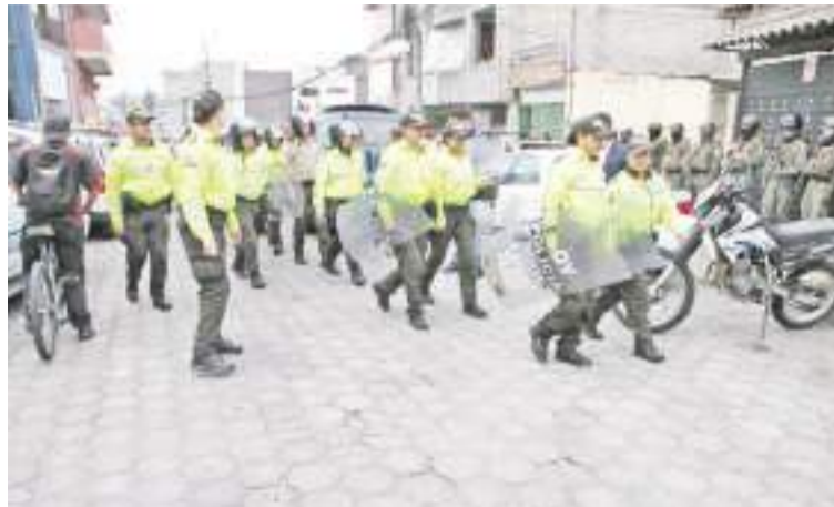
1月9日，厄瓜多尔警察在首都基多巡逻。

新华社北京1月10日电厄瓜多尔最大城市瓜亚基尔一家当地电视台的直播间9日遭数名蒙面武装人员袭击，现场画面在全国观众播出一段时间后，才被切断。警方已逮捕13名武装人员，并救出被挟持的电视台工作人员。