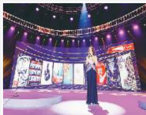
主持人介绍“中国纪录片放映计划”。

映交流、学术论坛、作品创投的系列活动，打造出“中国纪录片学院奖颁奖典礼”“光影映像”“光影论坛”等知名品牌，是国内以学术性、专业性、人文性、前沿性为标杆的纪录片领域盛会，在业界、学界等多个层面持续发挥影响力。