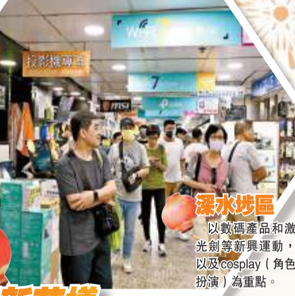
深水埗區 以數碼產品和激光劍等新興運動，以及cosplay（角色扮演）為重點。

國際會議方面，李家超介紹，今年首項年度金融及商界盛事亞洲金融論壇將於本月24至25日舉行。大量環球政商領袖將親臨香港，共同探討在當今經濟環境下推動多邊合作，實現可持續發展的重要性，同時凸顯香港國際金融中心優勢。