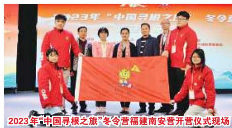
2023年“中国寻根之旅”冬令营福建南安营开营仪式现场