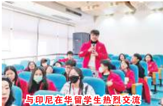
与印尼在华留学生热烈交流