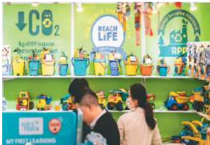
本届玩具展新推出的“绿色环保玩具”展区。

据新华社香港1月8日电(记者张雅诗)由香港贸易发展局主办的香港玩具展8日起在港举行,世界各地商家带来多款新产品,希望借此拓宽客源。