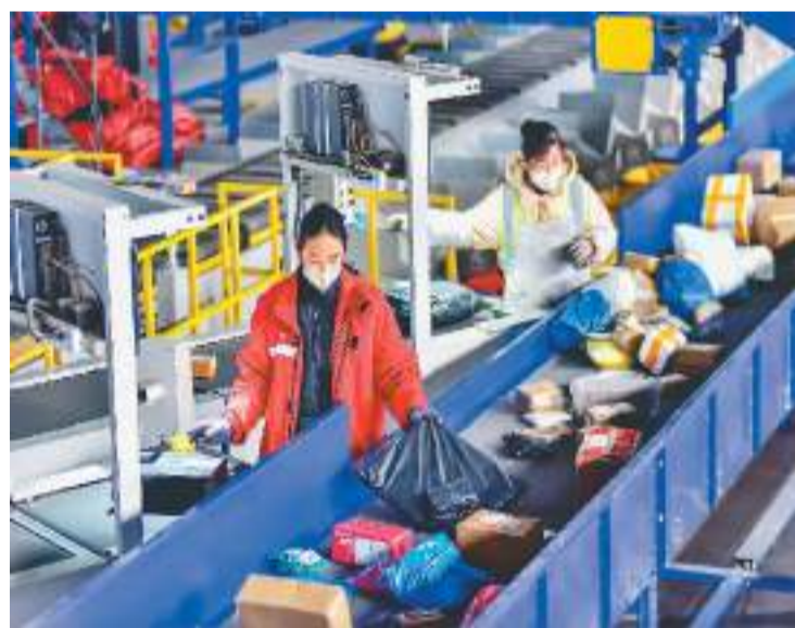
山东省青州市一家快递公司的工作人员正在利用自动分拣系统分拣快递包裹。