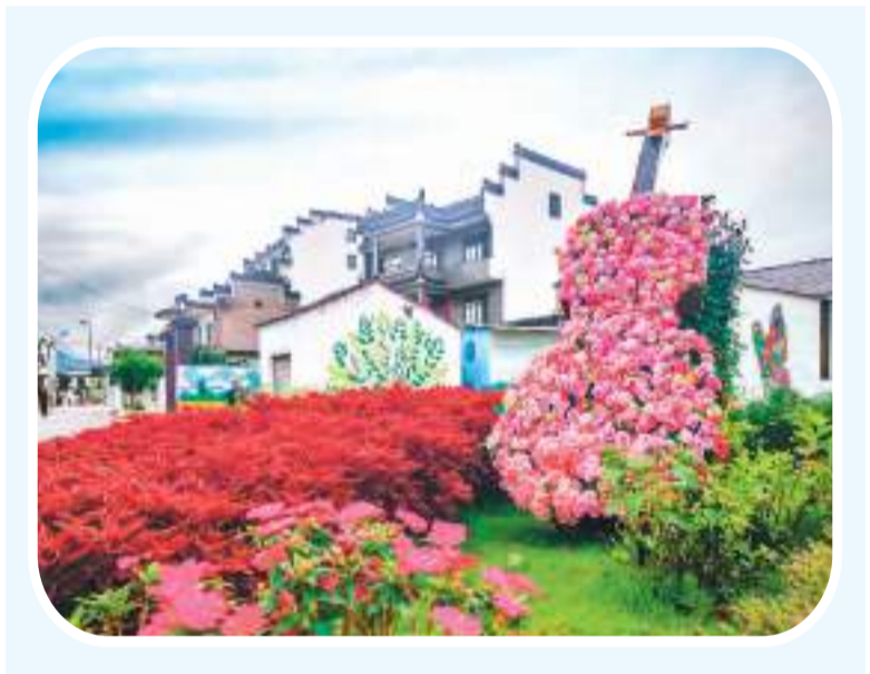
图为槐塘村中心的花园。

比萨斜塔、瓦伦西亚科学艺术城、荷兰风车、伦敦卡姆登市场、意大利亚里托市场……不少民居的墙壁上，一幅幅色彩斑斓的涂鸦墙绘仿佛把最具代表性的欧洲风情浓缩到槐塘村。此外，涂鸦墙绘还展现了槐塘村成为“安徽华侨第一村”的历程和一些引人入胜的自然景物。一些人家的门牌也引起了华商代表一行的注意：右侧一列，“华侨之家”4个大字尤为醒目，紧接着下方写着“中国的侨乡世界的槐塘”，下附门牌号和介绍槐塘村历史的二维码；左侧一列，分别为住户姓名、侨居国家、出国时间和从事行业。