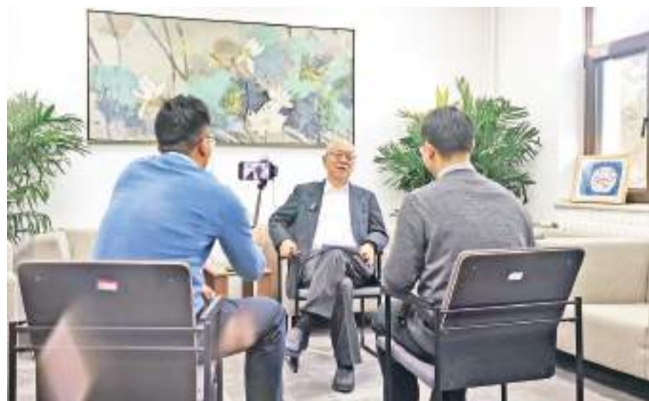
2023年12月28日，国际著名数学家丘成桐在清华大学静斋接受记者专访。

“除了书，我需要买的东西很少。”他说，“我不是很有钱，能够拿出来用于培养年轻人，我觉得