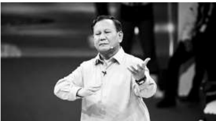
三号总统候选人普拉波沃。

《卫报》还收录了分析师对普拉波沃形象转变的看法。新加坡拉惹勒南国际研究学院印度尼西亚项目高级