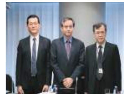
房委會昨日公布，預計租住房屋項目料有約11億元赤字。

至於資助自置居所運作帳目，經修訂後，2023/24年度房委會預計將有約115億元收入淨額。但房委會預計2024/25年度各項資助自置居所運作帳目的淨收入預計為22.31億元，較2023/24年度的收入為少，主要由於預期完成轉讓讓與的資助出售單位數量較少，由8200個下降至1400個。