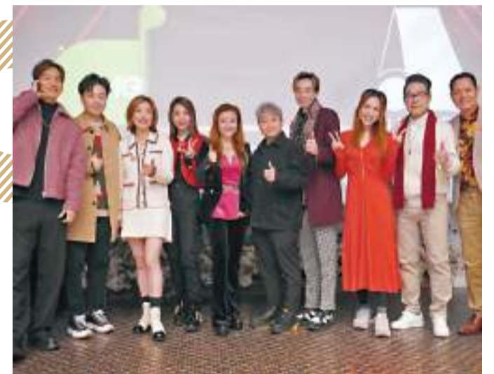
◆一眾《中年1》歌手齊聚。

坤哥被指是以TVB MUSIC GROUP(TMG)一哥身份到場,他即否認說不是,稱兩間公司都是一家人,還會自掏腰包用五位數購票,邀請在場所有人欣賞自己在本月28日舉行的演唱會,又感激傳出開騷消息後,很多朋友和友好單位都主動提出贊助。至於太太愛子會否上台支持,他打趣道:「她會支持我兩個星期的便當,因為我要減肥,還會幫忙打點。」講到只演一場很難回本?他認為不要吓吓講錢,製作上由公司全力支持。吉吉有份參與《中年好聲音2》節目中兩季成員對壘的PK賽,他透露在《中年2》揀選了一個靚仔及一個唱歌像說故事的一男一女做搭檔,稱讚兩位心水人選亦是自己很欣賞的人。問到今次重踏《中年》舞台是否壓力大減?他即說:「問得好!雖然都有壓力,但心情很不同、很輕鬆,去年參加比賽時,只要響起『燈燈燈燈』4下開始音效聲已經很緊張,而今次就很期待,並且很落力地參與編曲及提供想法,有信心今次兩季成員的合作會很精彩。」有指外間認為《中年2》的水準不及《中年1》;他認為可能《中年1》在這一年多了好多工作機會,穩定性和經驗都有所提升,其實《中年2》的實力都好勁。