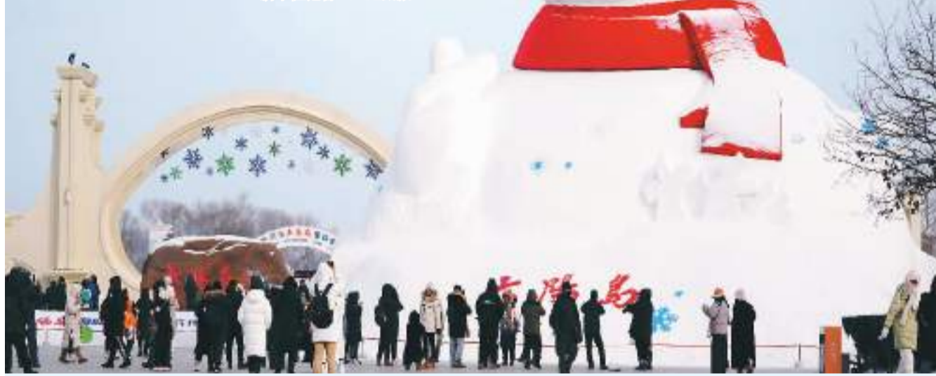
▼游客在哈尔滨太阳岛雪博会园区游玩。