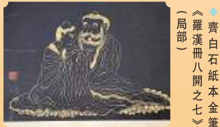
◆齊白石紙本金筆《羅漢冊八開之七》(局部)