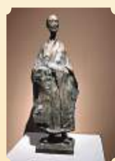
◆吳為山雕塑作品《弘一法師》