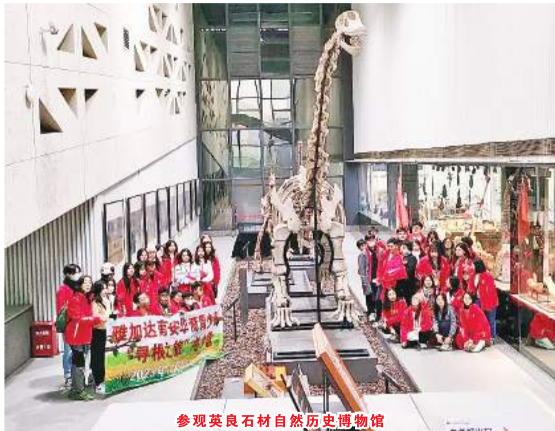
参观英良石材自然历史博物馆