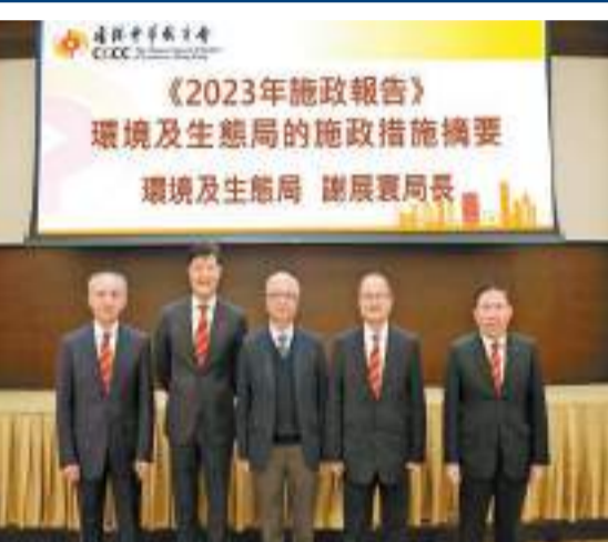
中總邀謝展寰介紹施政報告涵蓋的環境及生態政策。

【香港商報訊】 香港中華總商會每月均會邀請高官或各界人士到會演講分享政策及社會熱點。該會日前邀請特區政府環境及生態局局長謝展寰蒞臨，介紹施政報告涵蓋的環境及生態政策，特別是如何實踐環保碳中和目標，並與該會成員交流意見。 謝展寰表示，香港將致力爭取於2050年前實現碳中和，特區政府已就淨零發電、節能綠建、綠色運輸、全民減廢4大範疇制訂減碳策略，並力爭在2035年前把香港碳排放量從2005年水平減少一半。 新一份施政報告提出一系列環境保護及相關議題的施政措施。節能減碳方面，當局將就修訂《建築物能源效益條例》諮詢業界，包括擴大監管範圍至更多類別的建築物、強制公開能源審核報告資料及縮短能源審核周期等，並會在船灣淡水湖發展大型浮動太陽能系統。綠色運輸方面，當局計劃在2027年年底前引入約700輛電動巴士和近3000輛電動的士、將公共和私人充電停車位的總數提升至約20萬個，並在今年制訂全港公共巴士和的士綠色轉型路線圖及時間表，逐步取代柴油巴士與石油氣的士。特區政府今年亦將制訂《香港氫能發展策略》，並展開修訂與製造、儲運和使用氫能相關法例的準備工作。