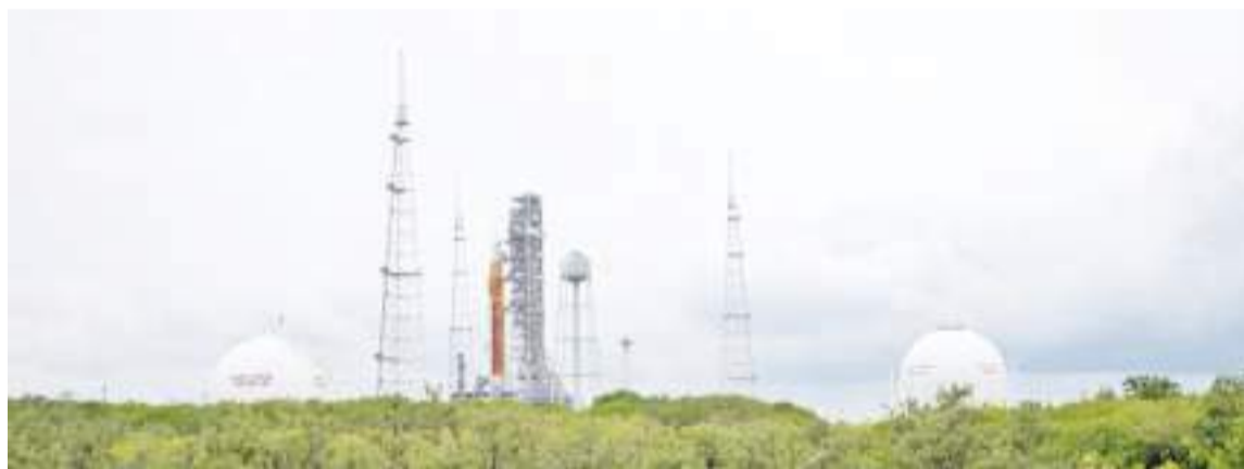
这是2022年4月2日在美国佛罗里达州肯尼迪航天中心拍摄的美国航天局新一代大推力运载火箭“太空发射系统”和安装在火箭顶端的“猎户座”飞船。