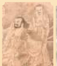
◆仇英款紙本工筆《白描羅漢像手卷》(局部)