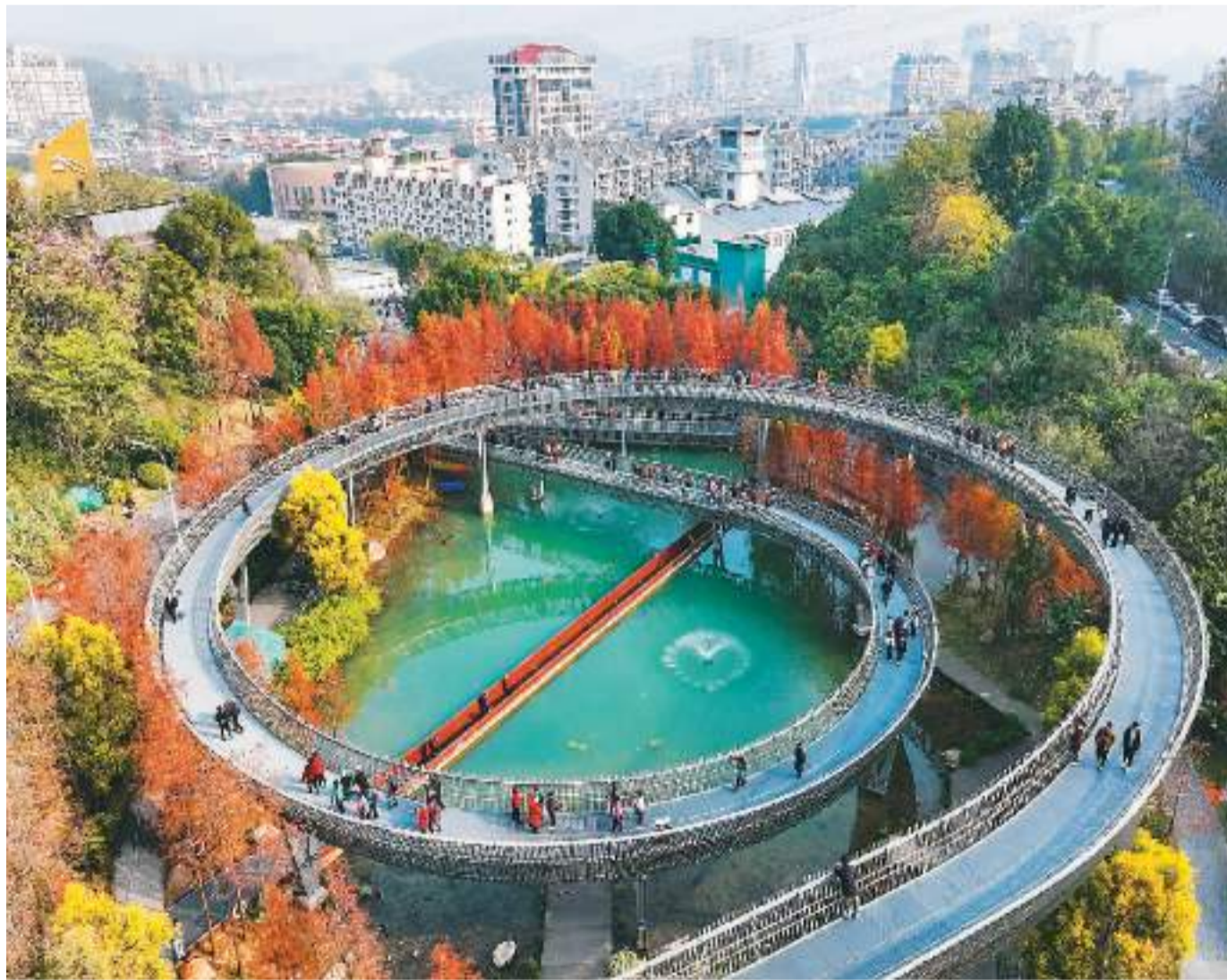
福建省福州市鼓楼区近年聚焦城市生态公园建设，打造“福道+水杉林、枫树林、银杏林”等特色林木景观，让市民拥有更多幸福感。

她表示，作为友好近邻，中方坚定支持孟方依法推进大选后各项政治议程，愿在相互尊重、平等互利、互不干涉内政等原则基础上，同孟加拉国新一届政府一道，进一步弘扬传统友谊，深入推进高质量共建“一带一路”，推动中孟战略合作伙伴关系取得新的更大发展。