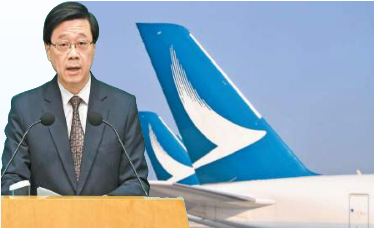
國泰航空近期持續取消部分客運航班，李家超表示特區政府非常關注有關情況。

【香港商報訊】實習記者凌瀚、記者戴合聲報道：國泰航空近期持續進行「航班調度」，短時間內取消多次航班。昨日，行政長官李家超出席行政會議前會見媒體時對此表達關注，要求國泰應檢視人力運力等方面的發展和安排，確保將受影響旅客的不便以及損失降至最低。