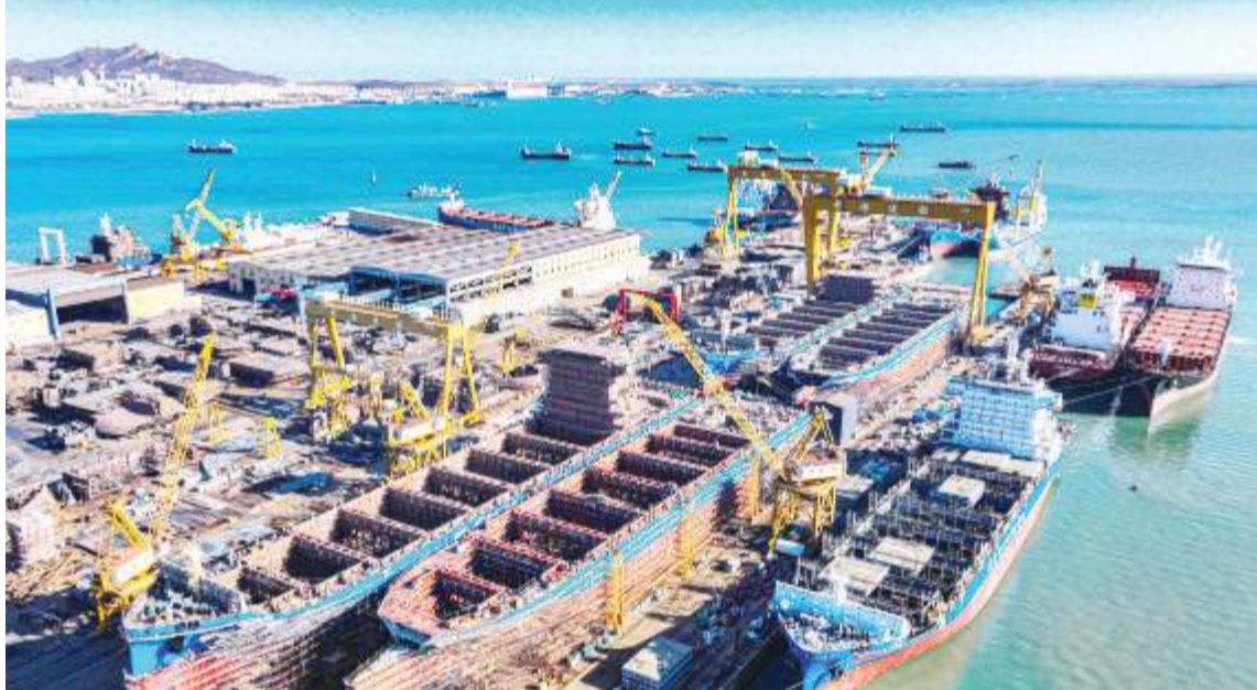
1月10日,在山东省荣成市石岛管理区黄海造船有限公司船坞内,工人抓紧建造各类大型船舶(无人机照片)。目前,该企业手持各类高附加值船舶订单超过70艘,所有船台持续保持满负荷生产状态,出口占比已接近总产量七成。

国际评级机构惠誉中国企业研究董事杨菁表示,预计2024年将有更多中外汽车制造商、供应商开展各种形式的合作,包括生产外包、技术授权、成立合资企业等。