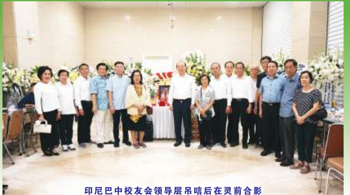
印尼巴中校友会领导层吊唁后在灵前合影