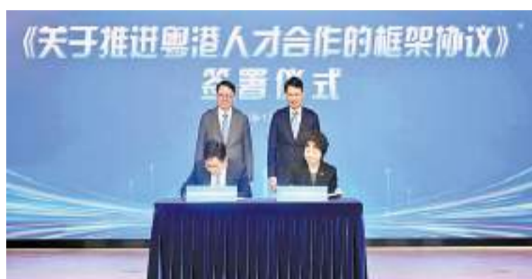
陳國基（後排左）和程福波（後排右）見證簽署《關於推進粵港人才合作的框架協議》。

陳國基指出，過去一年，特區政府貫徹落實「搶人才、留人才」的政策措施，並取得顯著成果，全年共吸納超過22萬宗申請，當中至今超過13萬宗獲批，約九萬名人才已抵港。此外，人才辦將於今年5月舉辦「全球人才高峰會暨粵港澳大灣區人才高質量發展大會」，向世界展示香港在「一國兩制」下背靠祖國、聯通世界的獨特優勢，推動區域招攬人才交流合作。