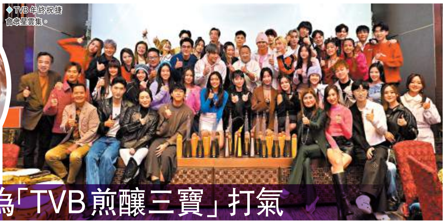
◆TVB年終祝捷會眾星雲集。