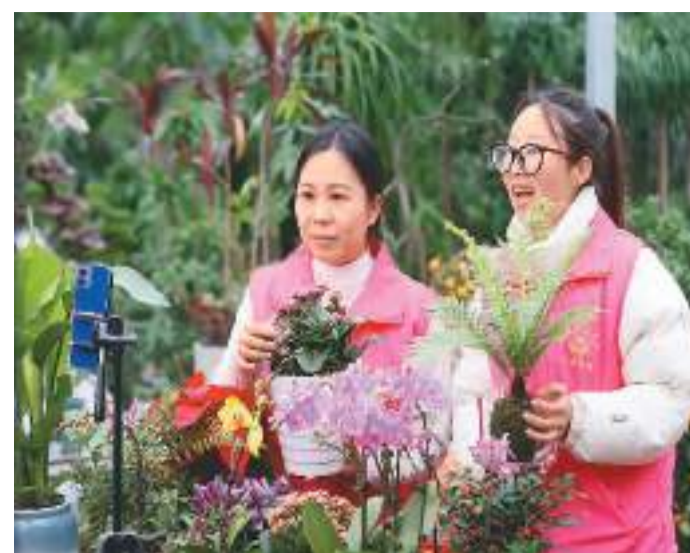
1月8日，浙江省湖州市德清县高越镇举办首届“共富村播云嗨购”直播带货节，9个行政村的青年播客联动直播销售农产品，拓宽“土货”销售渠道，增加农户收入。图为高越镇三林村青年播客在直播销售花卉。

专家认为，《意见》的突出特点是强化国有资本经营预算的功能作用、健全收支管理和提升资金效能，将有助于进一步支持国有资本和国有企业做强做优做大，提升企业核心竞争力。