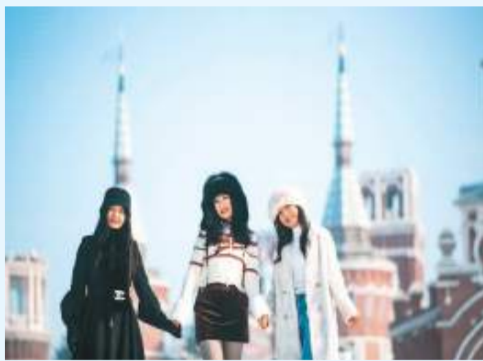
▲1月7日，游客在哈尔滨伏尔加庄园内拍照留念。