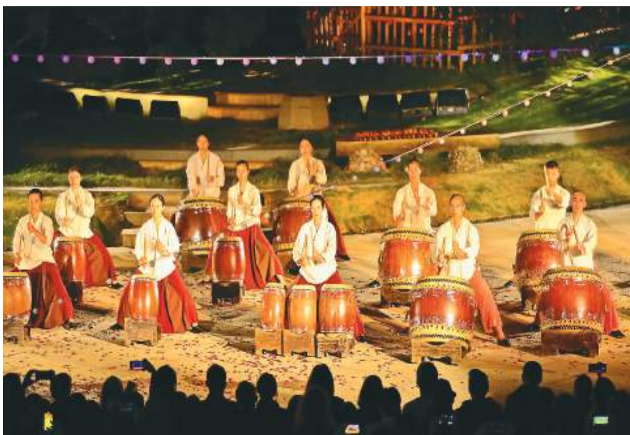
近日,江西省赣州市会昌戏剧小镇举办首届戏剧季,台湾导演赖声川的《宝岛一村》、香港话剧团的《姊妹》等200多个节目竞相上演。图为台湾优人神鼓团队在表演。

目前,研究团队正筛选新的候选药物并测试它们在细胞和果蝇模型中抑制神经细胞死亡的功效。随后,团队计划在鼠类和灵长类模型上测试有潜力的候选药物,以进一步评估其有效性。