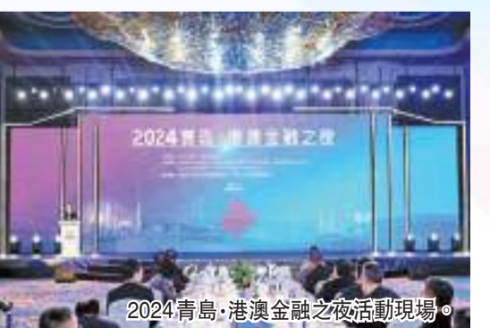
2024青島·港澳金融之夜活動現場。

態服務實體經濟，截至目前，西海岸新區集聚各類金融機構累計242家，其中納入監管的各類地方金融組織86家，資產規模571.39億元人民幣。未來，