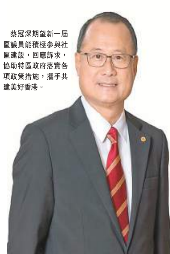
蔡冠深期望新一屆區議員能積極參與社區建設，回應訴求，協助特區政府落實各項政策措施，攜手共建美好香港。

【香港商報訊】 由本報聯合各大商會、社團舉辦的「2023香港商界最關注的10件大事」評選活動每年均吸引眾多港人參與。在香港中華總商會會長蔡冠深眼中，2023年是充滿挑戰的一年，「香港逐漸通關復常」無疑令人關注，而「共建『一帶一路』倡議十周年」、「李家超發表第二份施政報告」、「第七屆區議會選舉成功舉行」等均為大事，「香港擁有『背靠祖國、聯通世界』的獨特優勢，期待特區政府落實各項政策措施，與各界攜手共建美好香港，寫好良政善治新篇章。」 香港商報記者 雷虹