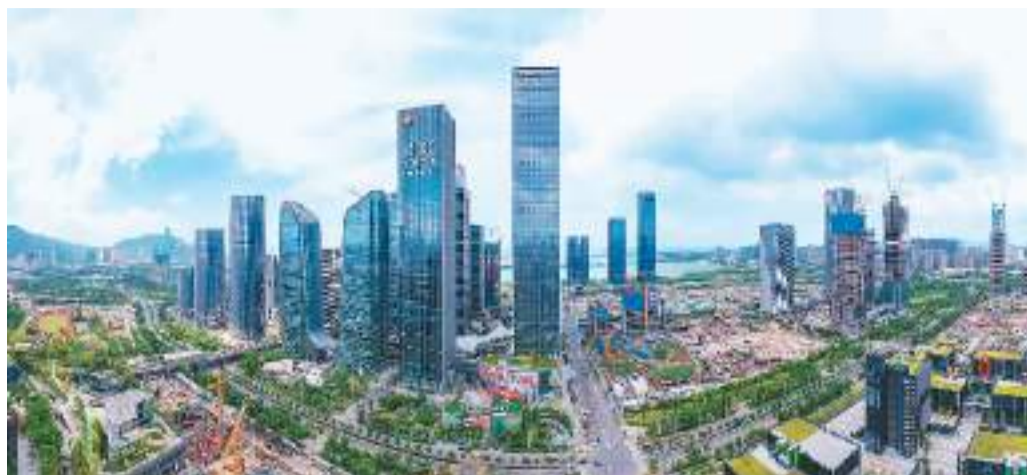
深圳前海深港现代服务业合作区。

国家发改委日前发布《前海深港现代服务业合作区总体规划》(以下简称“前海规划”),首次赋予前海“深港深度融合发展引领区”定位,要求前海坚持依托香港、服务香港,“加快推进规则机制一体化衔接、基础设施一体化联通、民生领域一体化融通,促进粤港澳青少年广泛交往、全面交流、深度交融,为香港经济发展进一步拓展空间”。