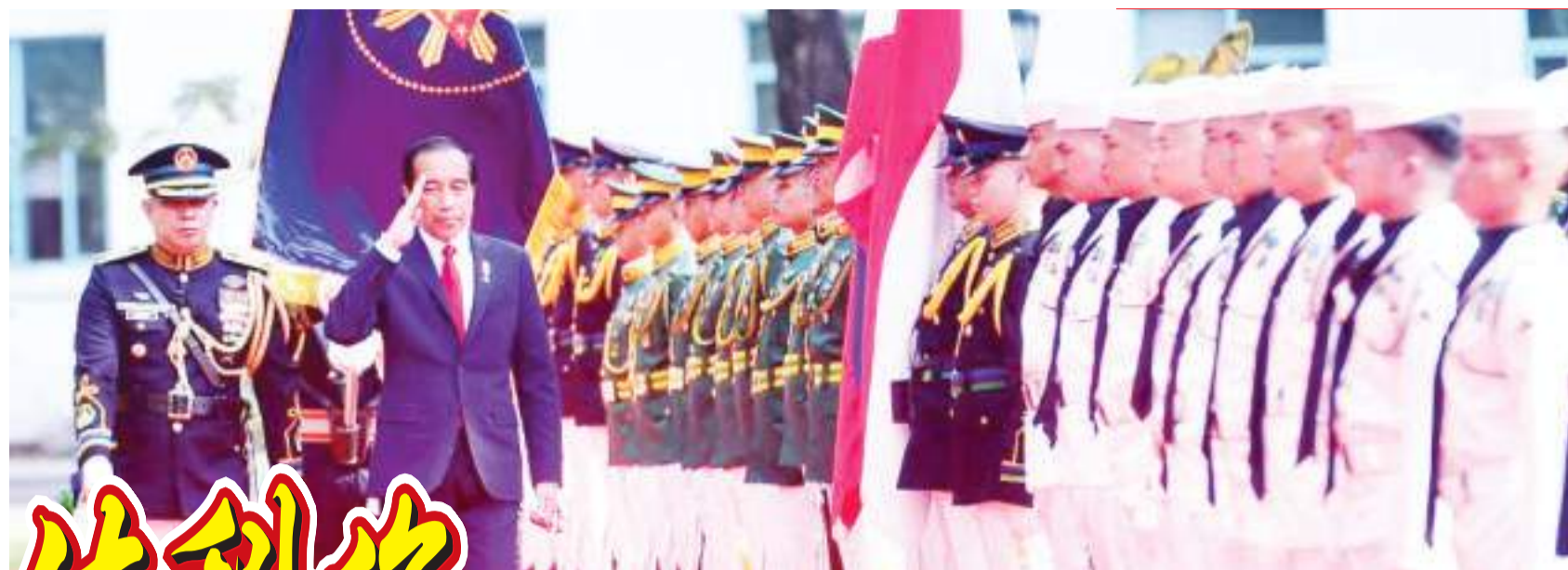
佐科维总统访问菲律宾 1月10日，佐科维总统抵达菲律宾马尼拉，并在马拉坎南宫检阅仪仗队。接着与小马科斯总统共同主持印菲双边会议。