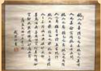
◆趙樸初書法《藕益大師四無量心頌》