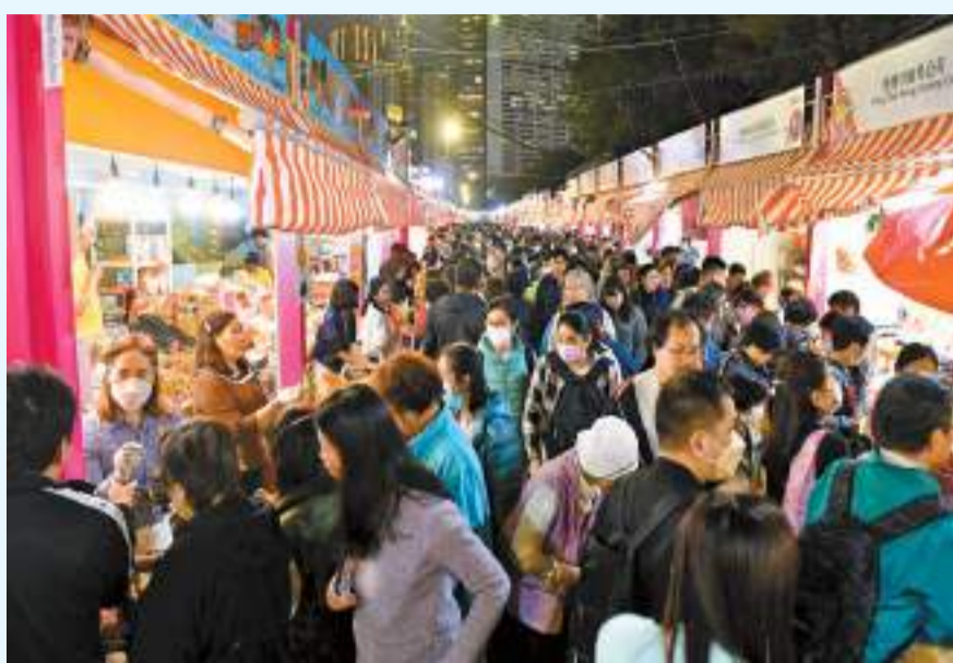
大批市民趁工展會熱科日入場掃平貨。

【香港商報訊】記者周偉立報導：香港愈夜愈繽紛。由香港中華廠商聯合會（廠商會）主辦的「第57屆工展會」昨晚8時圓滿閉幕。在聖誕新年的傳統消費旺季，以及特區政府「夜繽紛」活動成果的帶動下，為期24天展期人流暢旺，吸引超過130萬人次入場支持，人流較去年增加兩成，並創下超過10億港元的銷售總額。同日，旅發局再宣布明日派發「香港夜饗樂」餐券詳情，為「香港夜繽紛」接力，愈夜愈有戲。