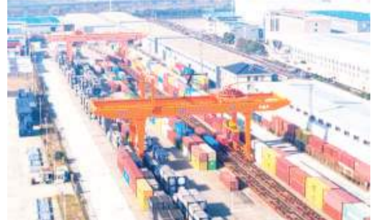
2023年12月25日,在中国铁路上海局集团有限公司海安物流基地,集装箱门吊进行集装箱装运作业。