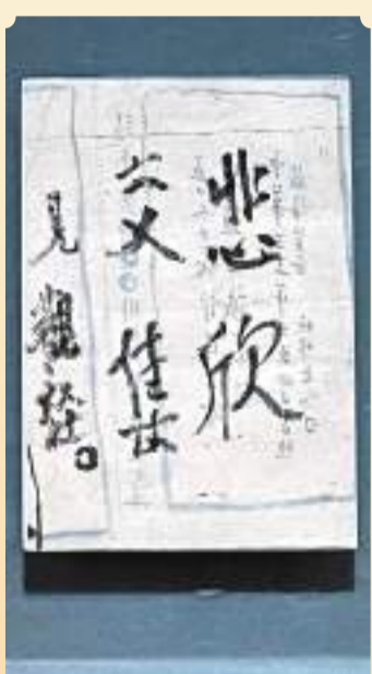
◆弘一法師《悲欣交集》遺墨

展廳中，還有約14世紀初期中峰明本書法、石濤中國畫《清芬共拂》、八大山人中國畫《墨竹鏡心》、任伯年中國畫《釋杖羅漢》、齊白石紙本金筆《羅漢冊八開之七》、吳冠中水彩畫作《五台山佛光寺唐塑》、饒宗頤中國畫《玉井蓮》、以及常沙娜在敦煌臨摹的初唐壁畫《燃燈菩薩》等佛教藝術珍品，展現出古今來佛教文化藝術的傳承。