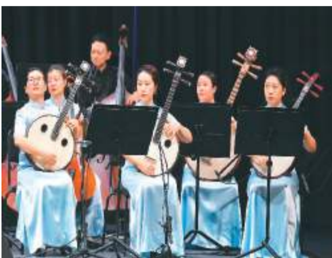
《江山如画》民族音乐会在莫斯科大剧院演出。