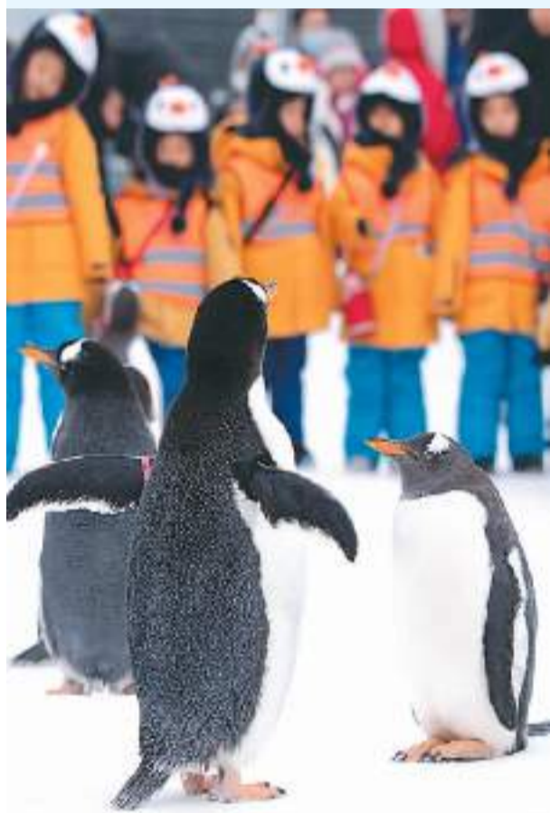
▲1月6日，在哈尔滨极地公园，来自广西壮族自治区南宁市的小朋友——“小砂糖橘”与企鹅进行互动。