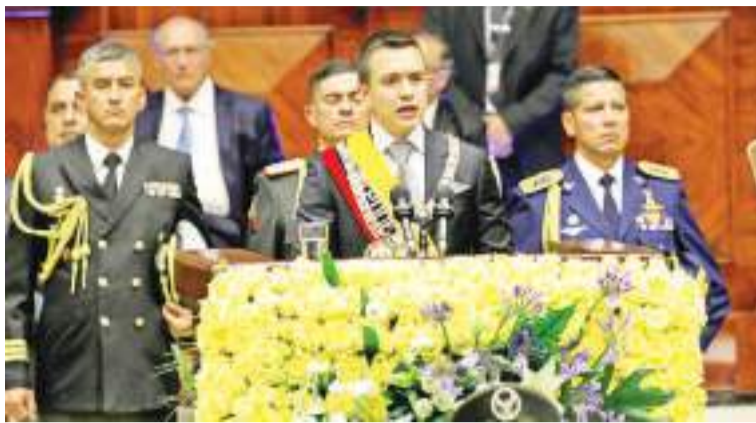
2023年11月23日，厄瓜多尔当选总统丹尼尔·诺沃亚(中)在首都基多发表就职演讲。