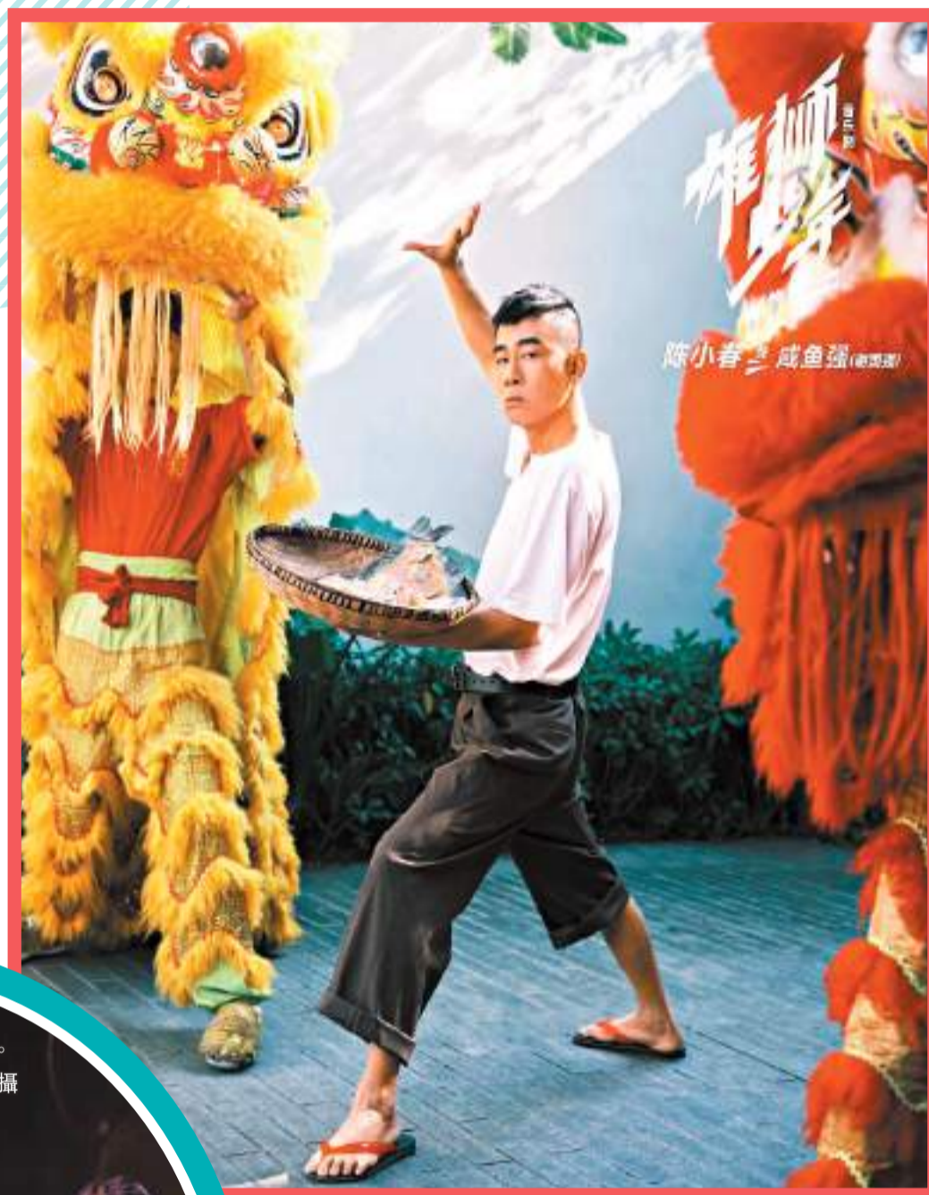
◆陳小春在《雄獅少年》中飾演「鹹魚強」。