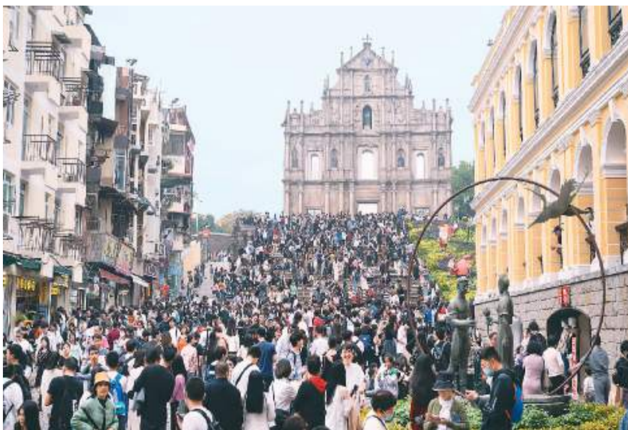
元旦假期，澳门新年气氛浓厚，美食美景丰富多彩，吸引各地游客来澳感受节日气氛。图为2023年12月31日，游客在澳门大三巴牌坊前游览。