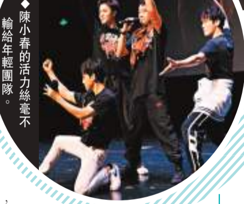
◆陳小春的活力絲毫不輸給年輕團隊。