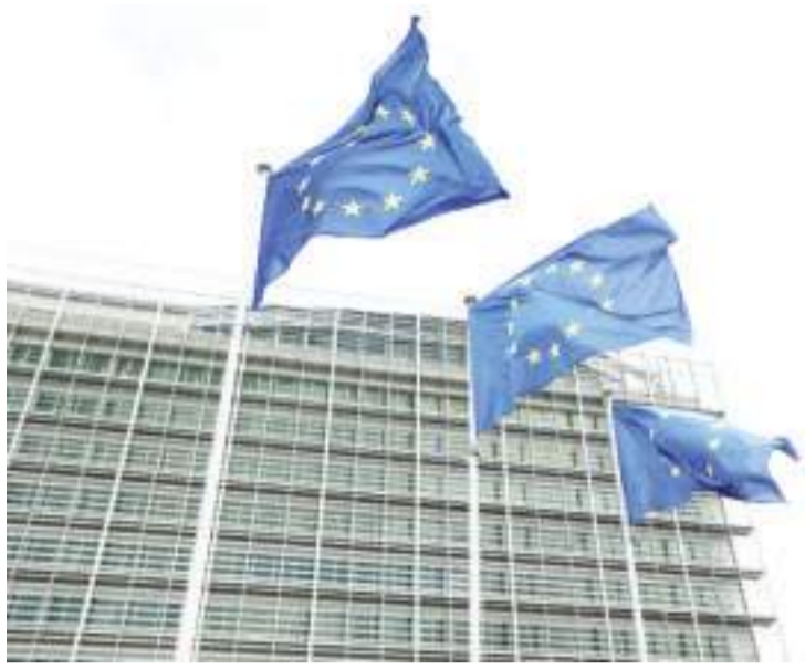
2023年11月15日，欧盟旗帜在比利时布鲁塞尔的欧盟委员会总部大厦外飘扬。

新华社北京12月31日电(国际观察)新华社记者欧阳为李洁 闫洁 2023年，世界经济继续从新冠疫情、乌克兰危机等负面因素影响中艰难复苏，但复苏动能不足、增长势头不稳、各国分化趋势扩大等特征凸显，地缘冲突加剧等多重风险给全球增长前景蒙上阴影。与此同时，全球新一轮科技革命和产业变革深入发展，数字化、绿色化转型不断深化，有望为世界经济提供新机遇、创造新条件。