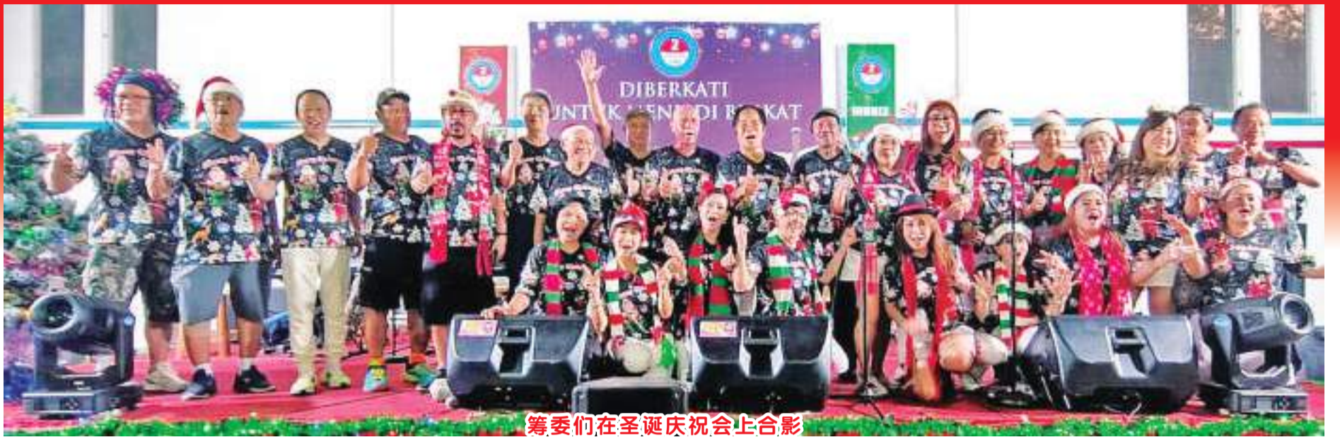
筹备们在圣诞庆祝会上合影

所有赴会朋友们,但愿圣诞的喜乐和平降临给各位来宾、感谢筹委会同仁的辛劳,使聚会能如期顺利举行。预祝2024年大家都蒙福和安康。同时他说:“在这个普天同庆的日子里,大家都平安喜乐。快乐之余,也要顾念到不太幸运的人们,包括失去父母的孤