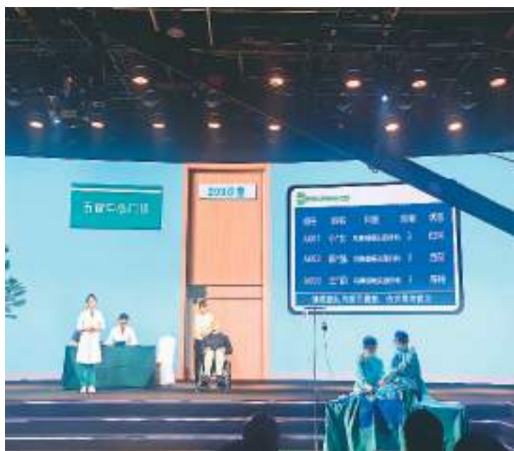
北京佑安医院医务人员表演情景剧《为“艾”而战》。