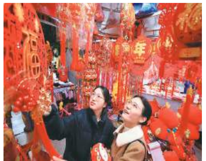
安徽省淮北市节日饰品市场洋溢着喜庆的氛围，各类传统挂饰琳琅满目，人们忙着选购商品，迎新年、庆元旦。图为市民在淮北市大兴市场选购新年饰品。

“根据有关规定，总的要求是对鼓励类项目，按照有关规定审批、核准或备案；对限制类项目，禁止新建，现有生产能力允许在一定期限内改造升级；对淘汰类项目，禁止投资并按规定期限淘汰。”前述负责人表