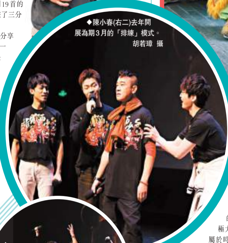
◆陳小春(右二)去年開展為期3月的「排練」模式。

講到眉飛色舞處，陳小春還不忘順手擺出幾個舞台招式。他全程較為活躍的臉部表情和身體語言都在告訴大家：他喜歡表演，也還在享受角色舞台。當然他也有了新的謀劃，他說：「或許，我們大灣仔之後可以弄一部音樂劇。所以，現在我要更好地來感受這個行業新標準。」