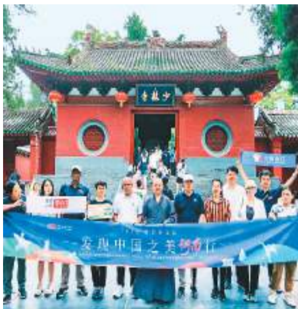
上图：驻华外交官参加2023发现中国之美河南行，在少林寺合影留念。