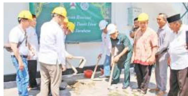
嘉宾在进行奠基仪式上

受邀嘉宾。哈啵柳源辉介绍,该大楼扩建是为了增加建筑物的空间。他说,“这座原本是2层的建筑将被建成3层。