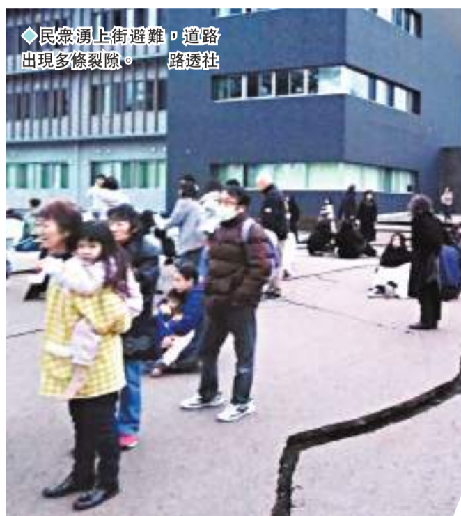
◆民眾湧上街避難，道路出現多條裂隙。

日本中部石川縣能登地區1月1日發生黎克特制7.6級地震，隨後發生連串最高達6級的餘震，日本氣象廳最初警告地震可引發達5米高的海嘯，到晚上8時半下調為1至3米海嘯警報。石川縣多地受災嚴重，大量房屋倒塌損毀，還有住宅區震後起火。日本放送協會（NHK）報道，截至當地時間2日下午1時，因地震死亡人數達30人，包括輪島市15人、珠洲市6人、七尾市5人、穴水町2人、羽咋市和志賀町各1人。