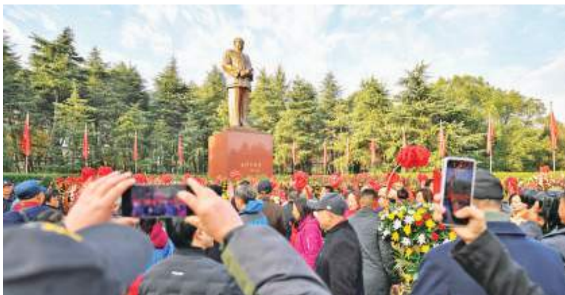
12月26日，人们在湖南韶山毛泽东铜像广场参观。

一百多年前，毛泽东同志说：“我们总要努力！我们总要拼命的向前！我们黄金的世界，光华灿烂的世界，就在前面！”今天，毛泽东等老一辈革命家开创的伟大事业正欣欣向荣，他们追求的伟大理想正在变成现实，中华民族伟大复兴展现出前所未有的光明前景。让我们更加紧密地团结起来，只争朝夕、顽强奋斗，沿着中国特色社会主义道路，为以中国式现代化全面推进强国建设、民族复兴伟业而奋勇前进！