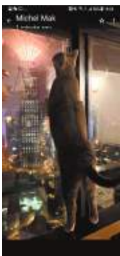
◆除夕夜，貓兒「荳荳」躍足遙望長江中心樓頂發放的四色「許願流星」煙花。

氣候的香港生活，今年剛好3歲，是牠第一次觀賞維港煙花匯演，看得出牠充滿好奇喜悅。這幾年間，牠和「喵喵」（也是較罕有在南方生活的「挪威森林貓」）一直與我們相伴相依，帶給大家許多歡樂和笑聲……更改變了我們的生活習慣：盡量不出戶！ 除夕夜推卻了一切邀約，留待家裏，遙望露台窗外的煙花美景，近看電視新聞直播的煙花報道——與家人、「荳荳」和「喵喵」共度，珍惜每一次的共聚、共賞每一