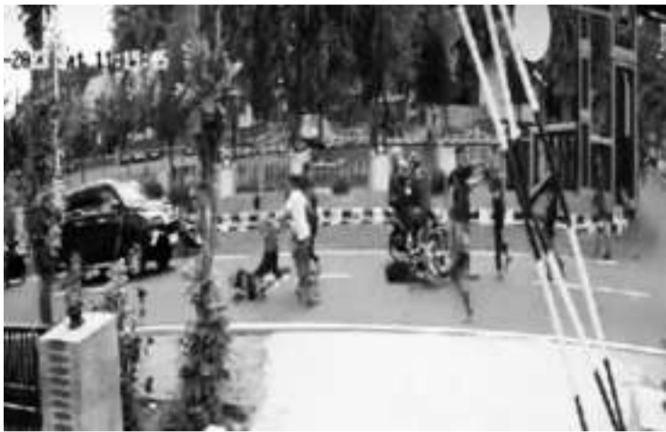
线上流传闭路电视所拍摄的拳打脚踢镜头。

【本报讯】保卫民主选举社会联盟(KMSKPD)第三号正副总统候选人甘贾尔-马福在中爪哇省波约拉里(Boyalali)进行竞选宣传活动,却被当地驻军一群士兵围殴,甚至造成一名志愿者死亡,另有四人受伤,由