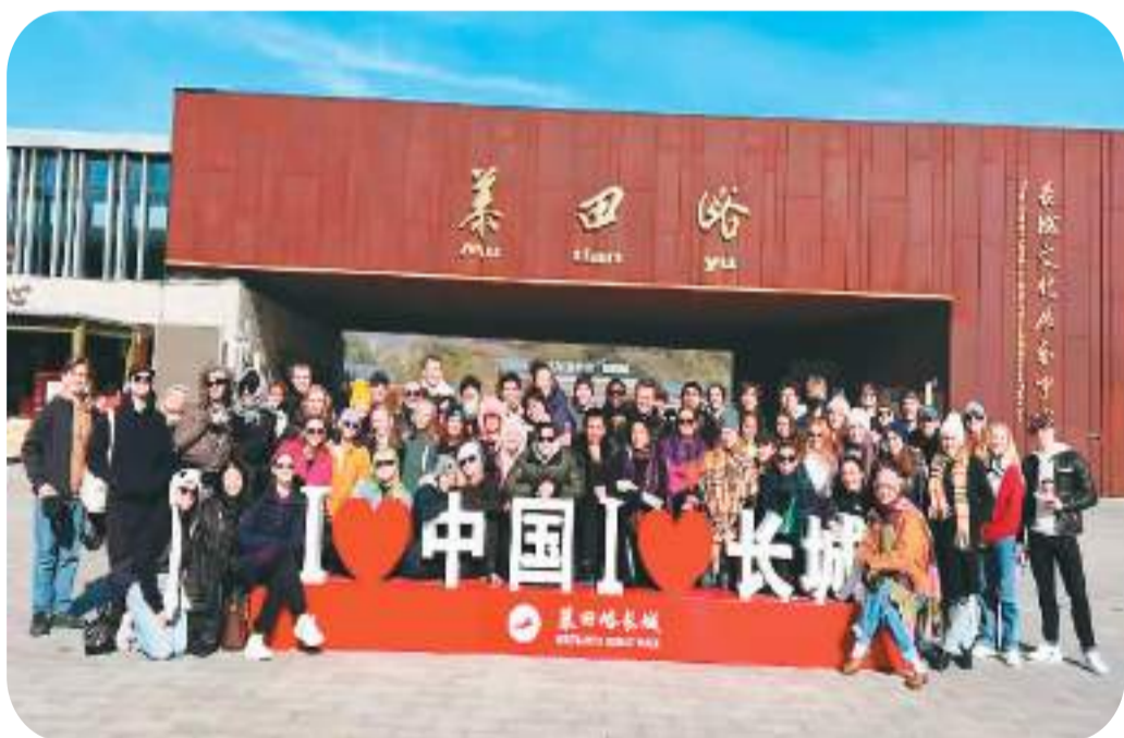
外国游客游览北京慕田峪长城。