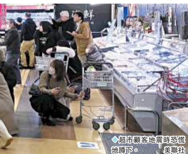
◆超市顧客地震時恐慌地蹲下。