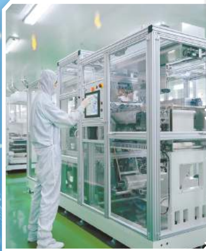
▲達利凱普智能生產線。