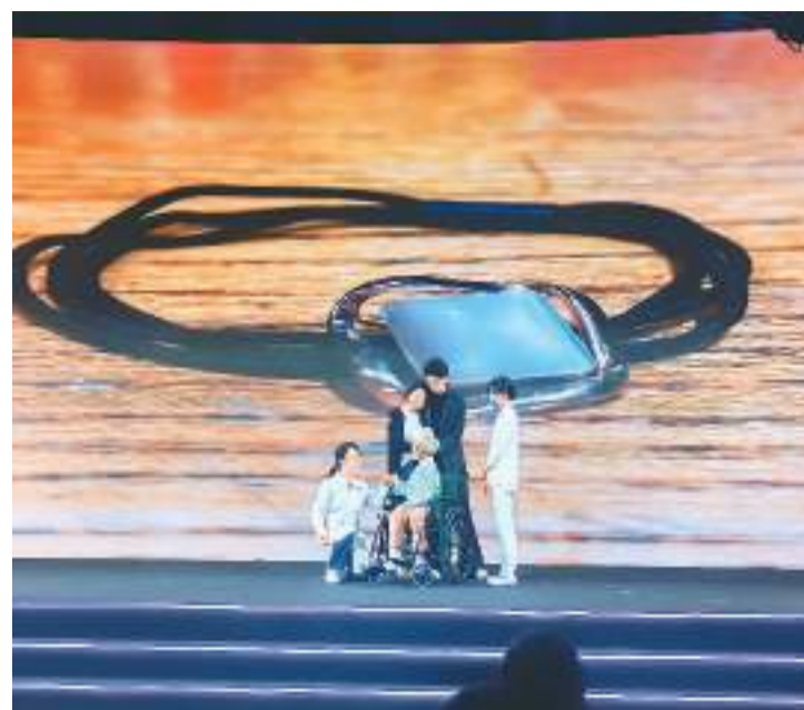
北京儿童医院医务人员表演情景剧《坏蛋歼灭战》。