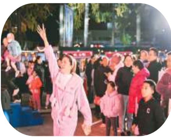
摩登歌会上，邻居小姐姐踊跃抢答“歌名猜猜猜”。

“南门外，水连天。古鉴湖，在眼前……”随着城南街道形象主题曲《南门外》MV首发，包括邻里集市、摩登歌会等活动在内的第17届“邻里节”日前在浙江省绍兴市越城区城南街道启动。