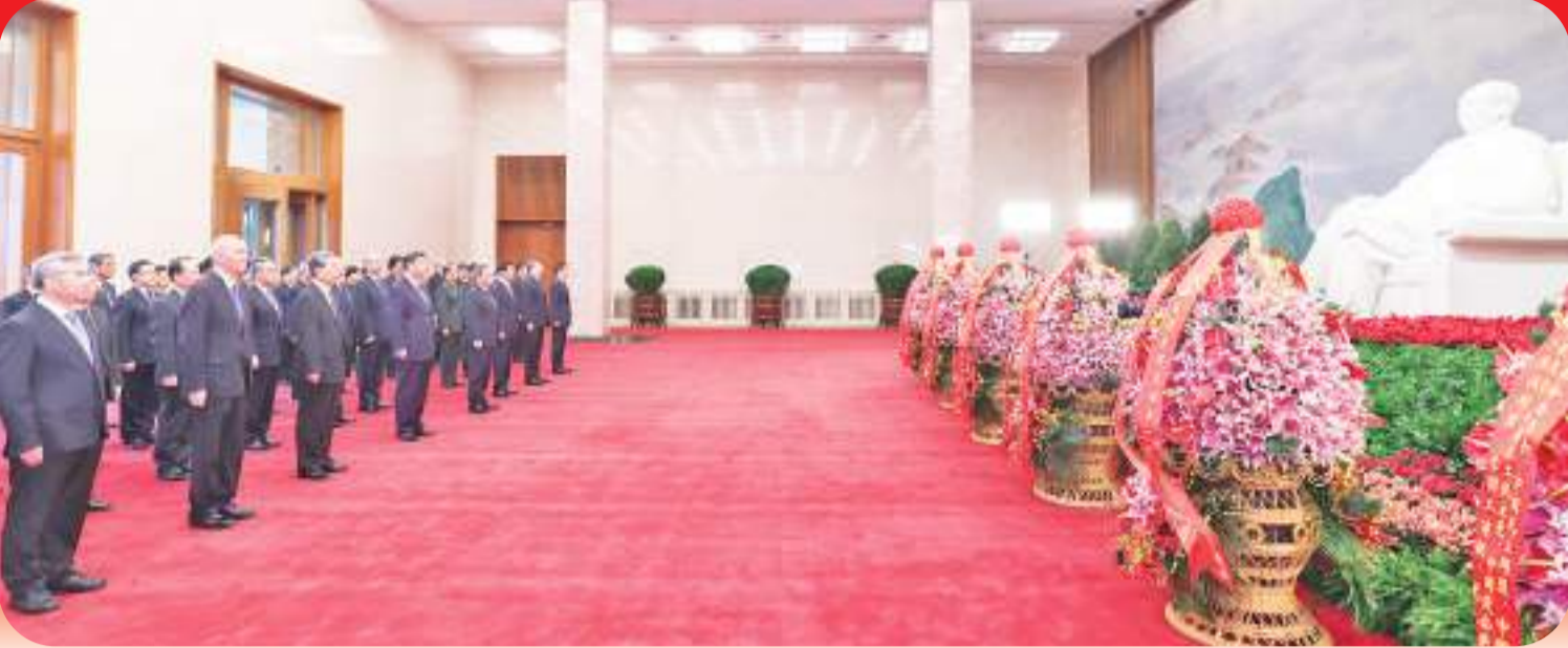
12月26日,中共中央在北京人民大会堂举行纪念毛泽东同志诞辰130周年座谈会。座谈会前,习近平、李强、赵乐际、王沪宁、蔡奇、丁薛祥、李希、韩正等领导同志来到毛主席纪念堂瞻仰毛泽东同志遗容。

毛泽东同志带领人民锻造了伟大光荣正确的中国共产党。中国革命、建设事业必须由一个先进政党来领导。毛泽东同志指出:“没有中国共产党人和努力,没有中国共产党人做中国人民的中流砥柱,中国的独立和解放是不可能的,中国的工业化和农业近代化也是不可能的。”毛泽东同志是第一批建立地方党组织的领导人之一,参加了党的一大会议,在井冈山斗争时