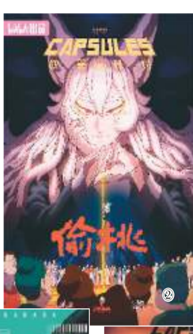
B站“胶囊计划”第二季部分作品海报：