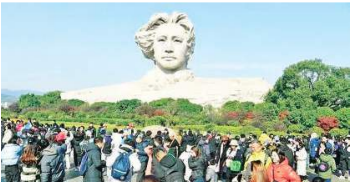
12月24日，湖南省长沙市橘子洲景区。