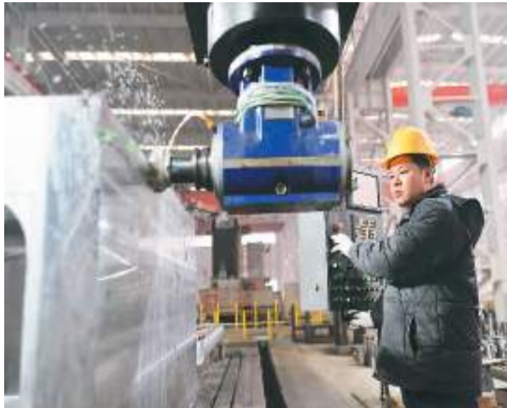
河北省唐山市曹妃甸区依托港口优势，积极引进重型装备、金属制品、新能源重型汽车等高端装备制造产业，打造临港装备制造产业基地，助推经济高质量发展。目前，该区规模以上高端装备制造企业达54家。图为工人在唐山市曹妃甸区一家装备制造企业车间工作。

推动产业结构调整是建设现代化产业体系、增强产业核心竞争力、促进产业迈向全球价值链中高端的重要举措。近日，国家发展改革委修订发布了《产业结构调整指导目录(2024年本)》，在行业类别、条目设置和表述规范等方面作出新规定。国家发展改革委有关负责人表示，《产业结构调整指导目录》在加强和改善宏观调控、引导社会资源流向、促进产业结构调整和优化升级等方面发挥了重要作用。