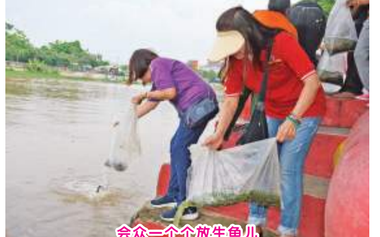
会众一个个放生鱼儿