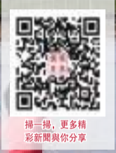
掃一掃，更多精彩新聞與你分享