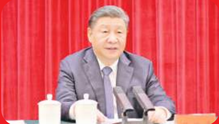
12月26日,中共中央在北京人民大会堂举行纪念毛泽东同志诞辰130周年座谈会。中共中央总书记、国家主席、中央军委主席习近平发表重要讲话。