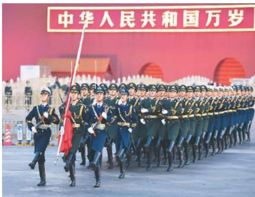
一月一日晨,北京天安门广场举行隆重的升国旗仪式。