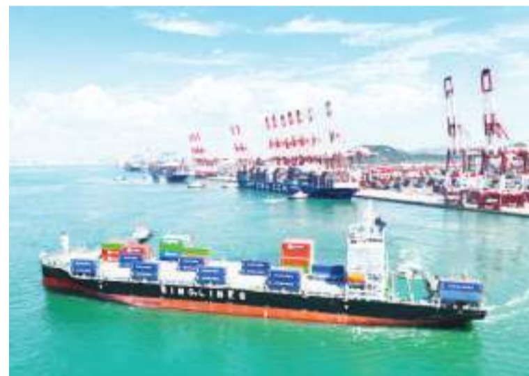
8月30日，“中外运海口”轮缓缓驶离山东港口青岛港，驶向印度钦奈港(无人机照片)。