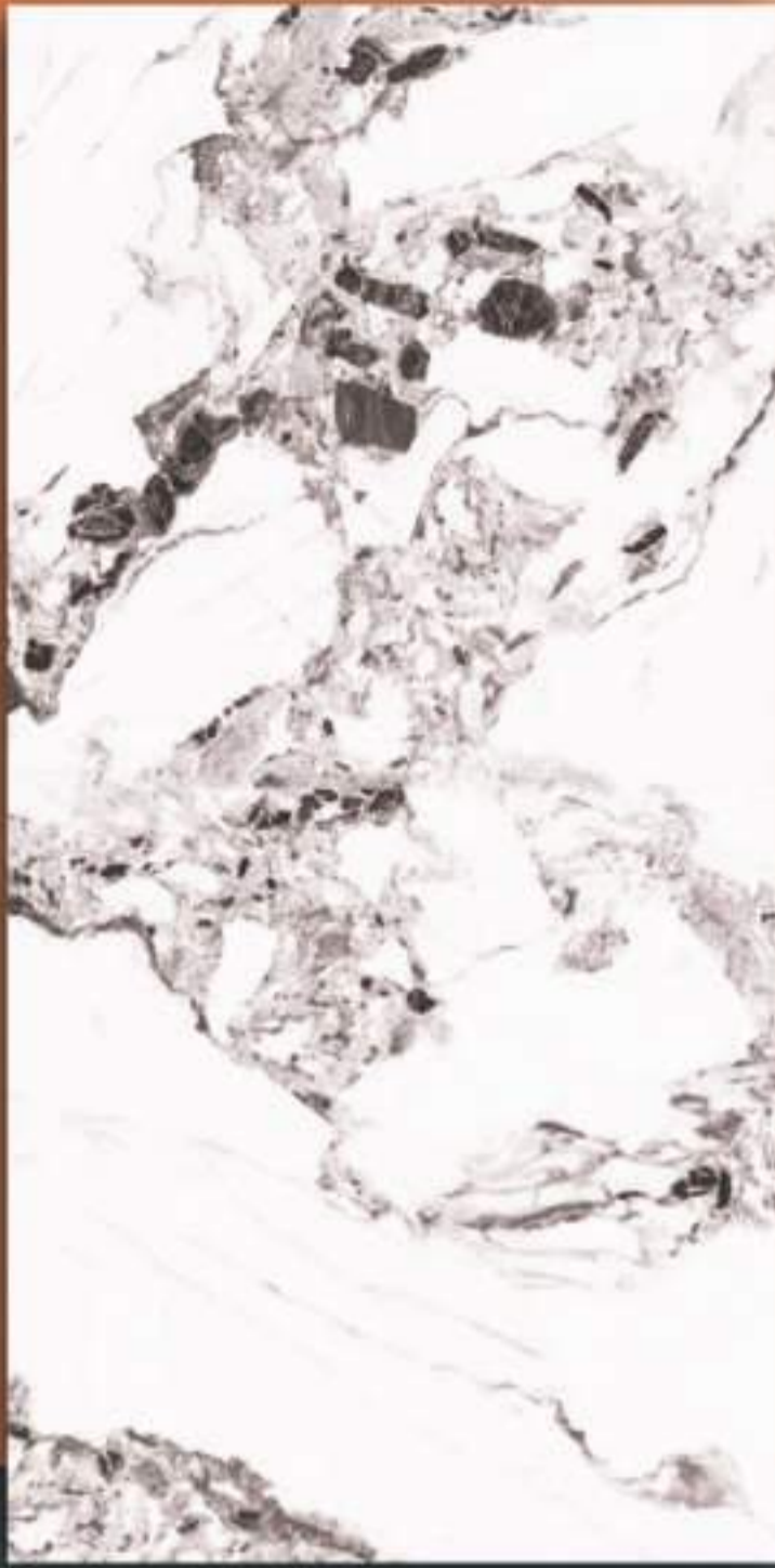
UKURAN BESAR 120x240cm