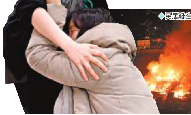
◆民屋發生大火。

石川地震前，鹿兒島當地時間1日下午3時左右，位於諏訪之瀨島的御岳火山也噴發，火山灰柱高達1,600米。