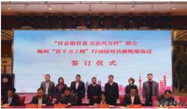
省工商聯9家商會與梅州市8個縣(市、區)工商聯簽訂結對共建框架協議。

(掌上梅州訊)12月19日,“百會助百縣 萬企興萬村”助力梅州“百千萬工程”暨梅州市招商引資推介活動在梅城舉行,來自廣東省各地市近80家商會會長、秘書長集聚一起,共話梅州機遇,共謀發展良策。