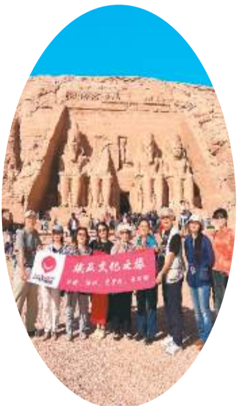
右图：中国游客体验埃及文化之旅。