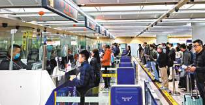
對六國單方面免簽政策實施以來，入境昆明的旅客明顯增多。

國家移民管理局相關負責人介紹，國家移民管理局部署全國邊檢機關在各口岸現場備足執勤警力、開足查驗通道，確保口岸通關高效率和順暢，同時指導各地公安機關出入境管理部門依法依規為免簽入境人員提供停居留便利。下一步將進一步優化出入境管理服務政策，協同有關部門，進一步便利外國人來華經商、學習、旅遊、工作、生活。