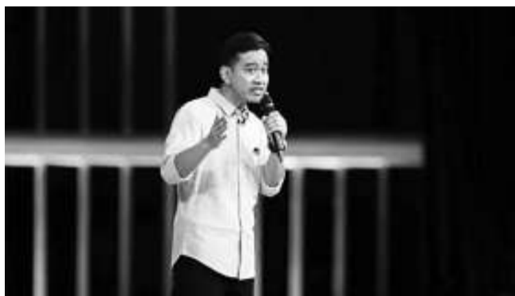
二号副总统候选人吉布兰在辩论会上的神态。

据《自由报》报道,“NepoBaby”一词不仅在政界很有名,而且在娱乐界也很有名。娱乐界的 NepoBaby 一词通常与成功