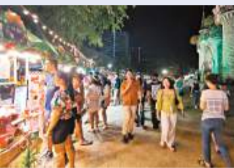
泰國總理宣布今年3月起對華永久免簽。泰國曼谷的喬德夜市元旦假期吸引眾多遊客。

賽塔當天在總理府舉行的發布會上說，此前已對中國公民實施了為期數月的入境臨時免簽政策。泰國政府一直與中國相關部門積極協商，最終決定自2024年3月1日起對中國公民實施永久免簽政策。他表示，這一措施不僅將對泰國旅遊業起到積極推動作用，同時也體現出兩國友好關係的進一步提升。