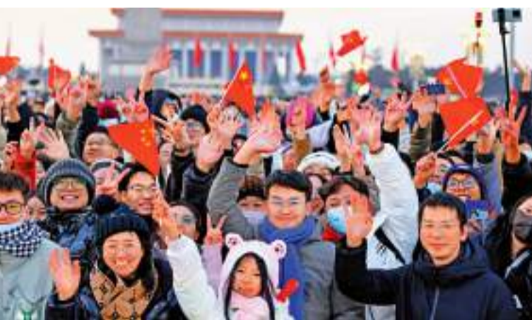
為眾多年輕人跨年奔赴的熱點城市。

同時，「90後」「00後」一代解鎖越來越多的新玩法，創造一波又一波的新熱度。其中，北方人到20°C的地方看海，南方人到-20°C的地方看雪，「南北互跨」成為2024年跨年新時尚。哈爾濱、廈門、三亞、麗江等南北地域特色明顯的城市，成