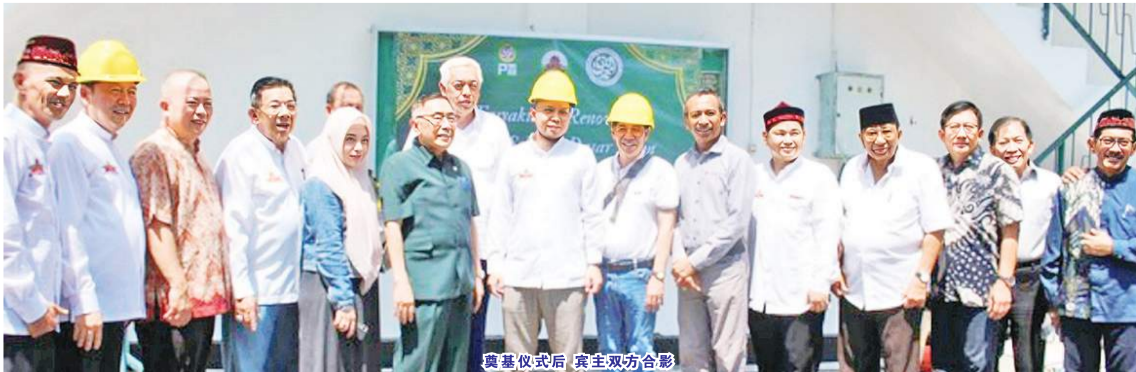
奠基仪式后 宾主双方合影