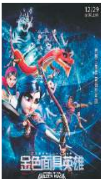
动画电影《金色面具英雄》海报。

《金色面具英雄》由四川金色映像文化传播有限公司、四川文化产业投资集团有限公司、峨眉电影集团有限公司、德阳发展控股集团有限公司、加拿大金色面具英