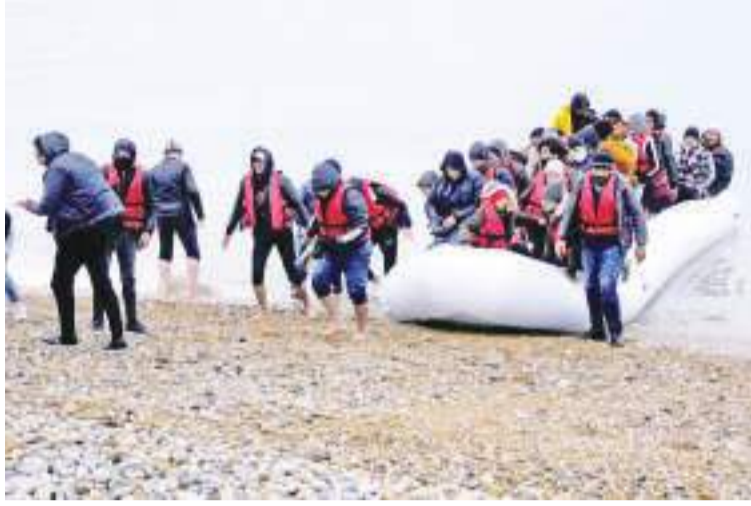
2021年11月24日,移民乘船抵达英国邓杰内斯角海岸。

英国2016年决定脱离欧洲联盟后,承诺加强边境管控。现任首相里希·苏纳克把“拦截偷渡船”作为关键工作之一。据英国