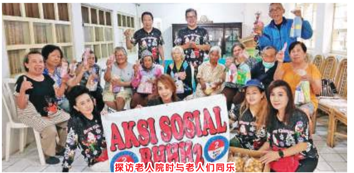
探访养老院时与老人们同乐