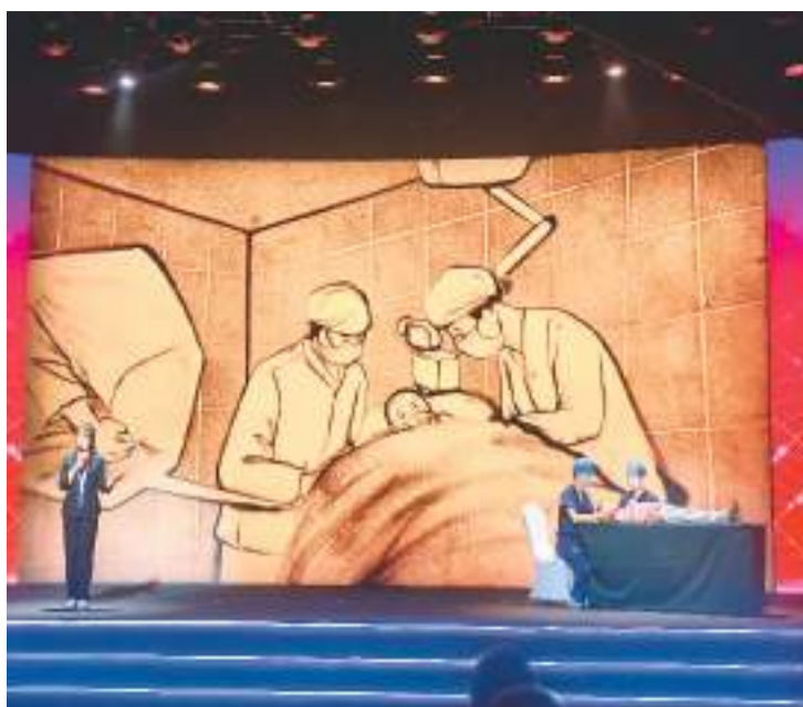
北京朝阳医院医务人员配合沙画表演情景剧《照亮》。