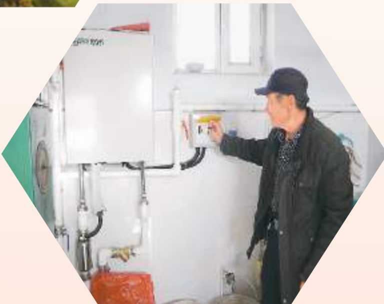
◀ 图为宁夏回族自治区固原市西吉县沙沟中学清洁供暖项目。当地农村中小学积极推广使用清洁能源供暖。目前固原市已有310所山区学校升级改造电锅炉（空气源热泵）、碳晶电暖器等清洁能源供暖，惠及在校学生3万余人。