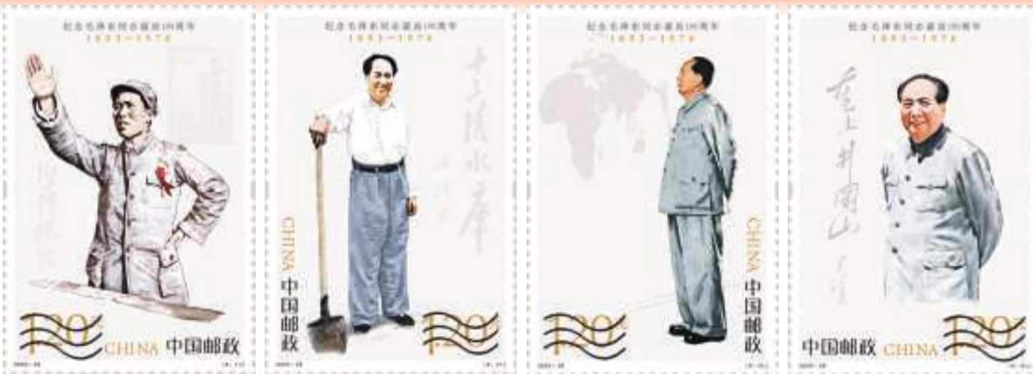
新华社北京12月25日电 中国邮政定于12月26日发行《纪念毛泽东同志诞辰130周年》纪念邮票1套4枚，邮票图案名称分别为坚持抗战、建设十三陵水库、胸怀天下、重上井冈山。

要充分激发全体人民的历史主动精神。人民，只有人民，才是创造世界历史的动力。中国式现代化是全体中国人民的事业，必须紧紧依靠人民，汇聚蕴藏在人民中的无穷智慧和力量，才能不断创造新的历史伟业。我们要坚持人民是创造历史根本动力的历史唯物主义基本观点，坚持人民主体地位，充分尊重人民所表达的意愿、所创造的经验、所拥有的权利、所发挥的作用，把维护好、实现好、发展好最广大人民根本利益作为一切工作的出发点和落脚点，让现代化建设成果更多更公平惠及全体人民。要健全人民当家作主的制度体系，发展全过程人民民主，保证人民始终是国家的主人、社会的主人、自己命运的主人，享有更广泛、更真实、更便捷的民主权利和自由。要完善维护社会公平正义的制度机制，保障人民平等参与、平等发展权利，让每一位辛勤劳动、艰苦奋斗、创新创造者都有梦想成真、人生出彩的机会。要着力保障和改善民生，办好各项民生事业，聚焦人民群众所思所盼所忧所急，解决好老百姓生活息息相关的就业、教育、医疗卫生、养老托幼、社会保障等民生问题，使人民获得感、幸福感、安全感更加充实、更有保障、更可持续，推动全体人民共同富裕取得更为明显的实质性进展。要把握新形势下群众工作的特点和规律，走好新时代群众路线，在深入实际、深入群众的躬身实践中，增进群众感情、把准群众脉搏、精准服务群众，满足人民多层次多样化需求，把工作做到人民群众心坎上，始终保持同人民群众的血肉联系，始终接受人民批评和监督，始终同人民同呼吸、共命运、心连心，使中国式现代化拥有最可靠、最深厚、最持久的力量源泉！