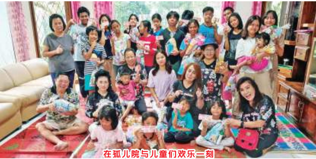
在孤儿院与儿童们欢乐一刻