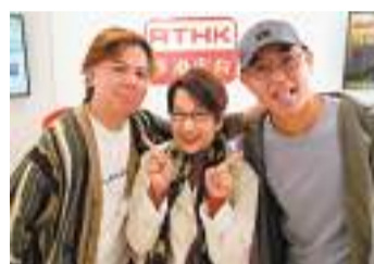
◆3位祝大家新年快樂！