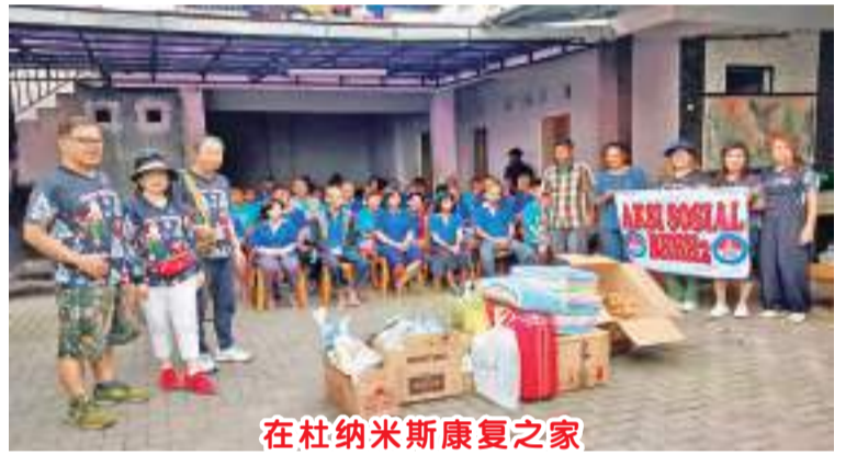
在杜纳米斯康复之家