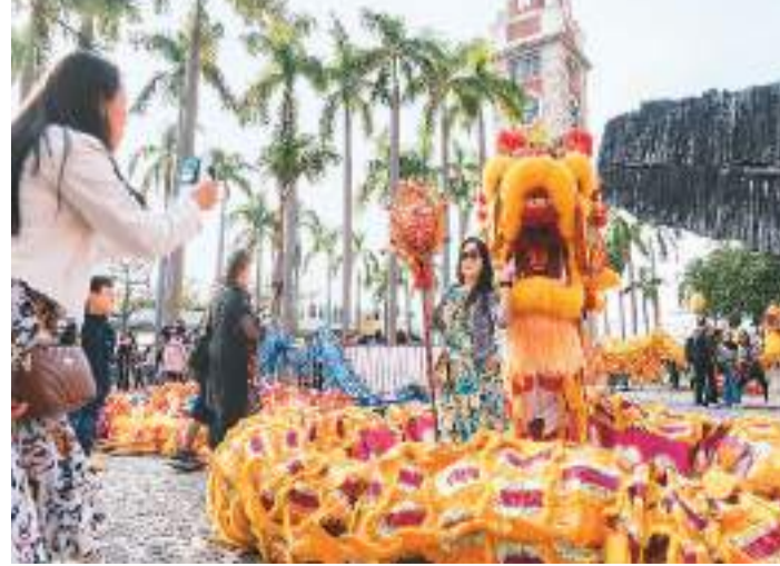
1月1日，“2024香港龙舞”活动在港举行，中国传统舞龙舞狮队的技艺展示和体验区的各式舞龙舞狮装备吸引市民和游客驻足体验，拍照打卡。中新社记者 侯宇摄

本届博览会由厦门市翔安区人民政府、厦门市农业农村局、中国农业科学院蔬菜花卉研究所联合主办。