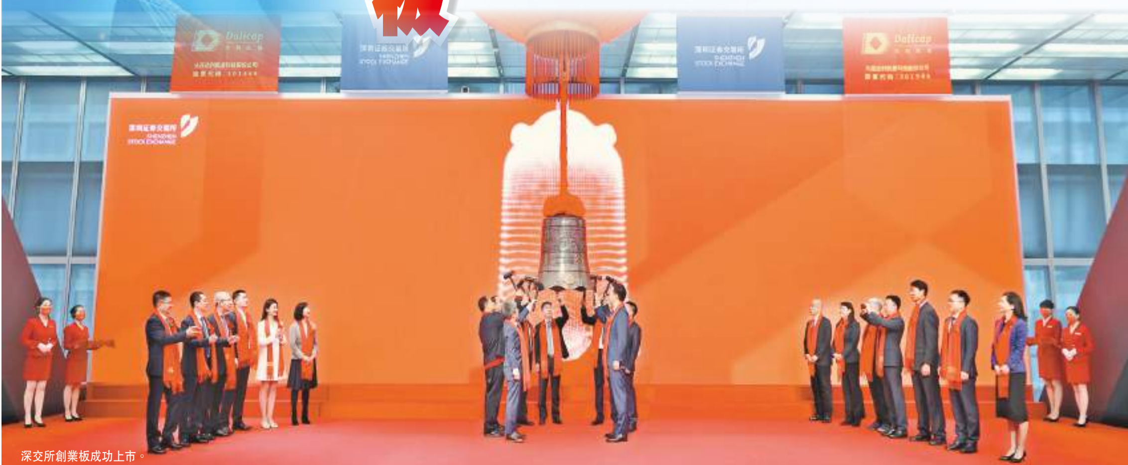
深交所創業板成功上市。