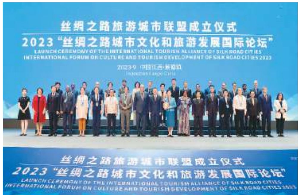
丝绸之路旅游城市联盟在江西景德镇举行成立仪式。