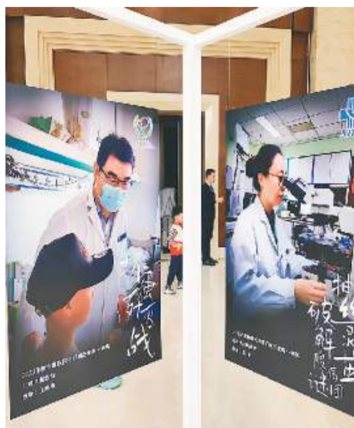
展演活动现场布置了优秀作品海报。

本次展演是竞赛的最后环节，前期经过平行病历培训、院内遴选、专家评审等环节，评选出优秀平行病历102篇，其中一等奖15名，二等奖20名，三等奖30名，优秀奖37名。本版将陆续把部分优秀作品呈现给读者。