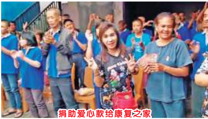
捐助爱心款给康复之家