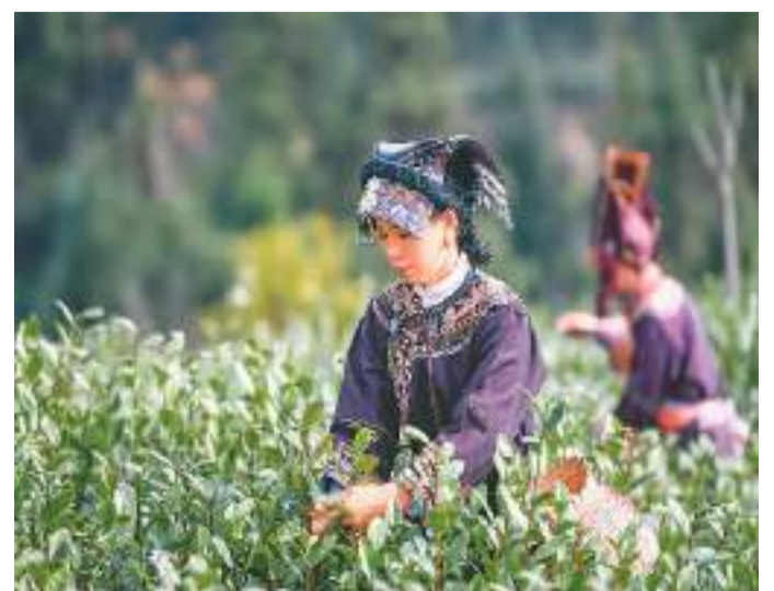
1月1日，全国早茶大会暨2024年“贵州绿茶”第一采活动在贵州省黔东南苗族侗族自治州普安县举行。普安县核心产茶区是全国绿茶开采最早的茶区之一。图为茶农在普安县江西坡镇高湖村罗家地采茶。

境的重要举措，采用“1+3+N”总体架构，即一个门户网站，突出“一”特点，场景化、友好型”的特点，通过5个分场景、3个阶段场景，实现对用户的精准导航和场景服务；3个海内外社交平台，聚焦发布和互动的资讯服务和贴心的生活服务；“N”代表一系列线上线下活动，将通过举办各类政策推介、业务咨询、主题沙龙、文化体验、学习培训等活动，提高用户满意度。