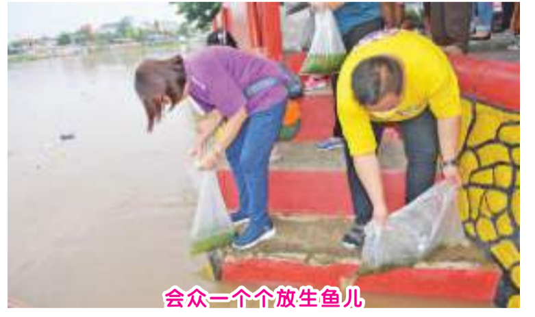
会众一个个放生鱼儿