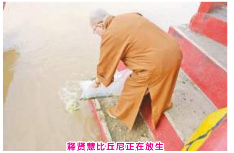
释贤慧比丘尼正在放生