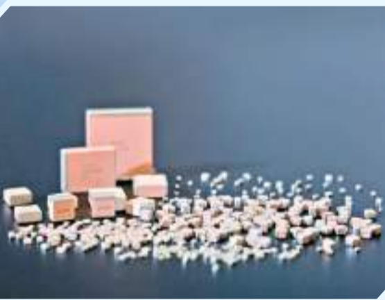
▲▼自主知識產權的國家級單項冠軍產品——射頻微波MLCC。

通過多年的技術沉澱，公司攻克多項關鍵核心技術，實現了核心電子元器件自主可控。公司擁有陶瓷材料和電子元件兩項體系技術，以及完整的研發、生產、檢驗技術平台和先進設備。公司承擔多項國家及省市級科技重大課題任務，科研成果及核心產品先後榮獲中國創新創業大賽電子信息成長組第一名、國家級製造業單項冠軍產品、中國電子元器件行業協會科技進步一等獎等；公司榮獲國家級專精特新重點「小巨人」企業、國家知識產權優勢企業、首屆遼寧省瞪羚企業、遼寧省省長質量獎等諸多殊榮。