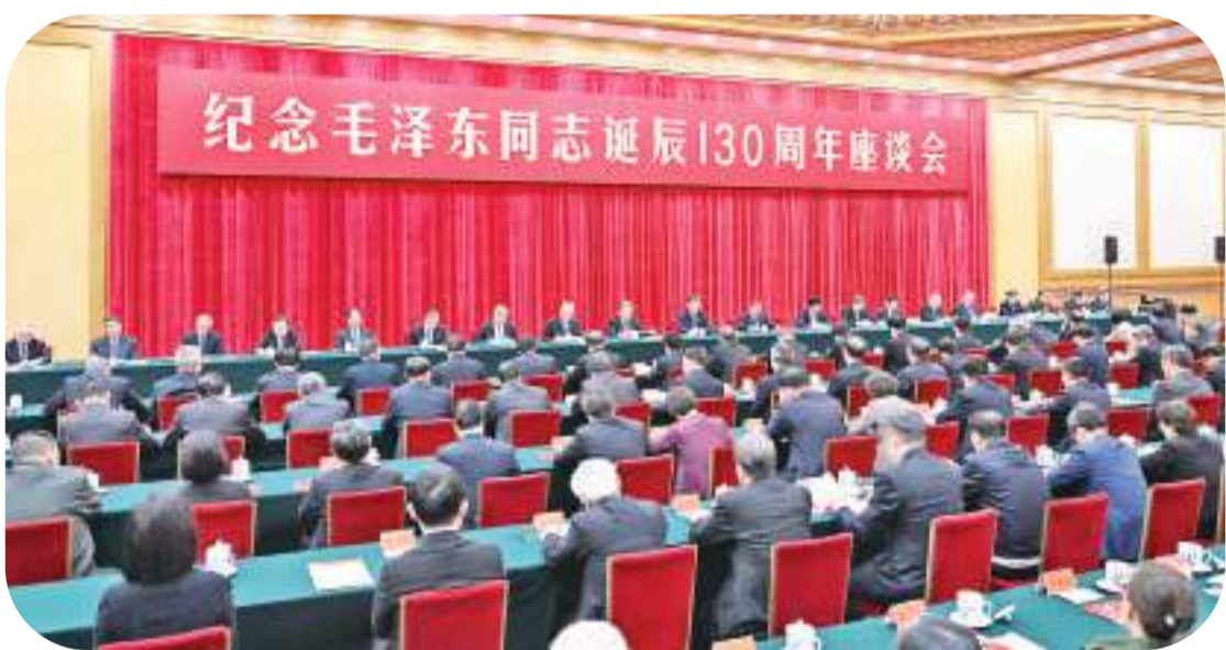
12月26日,中共中央在北京人民大会堂举行纪念毛泽东同志诞辰130周年座谈会。习近平、李强、赵乐际、王沪宁、蔡奇、丁薛祥、李希、韩正等出席座谈会。

毛泽东同志带领人民建立了人民当家作主的新中国。为人民谋幸福、为民族谋复兴是我们党的初心使命。我们党自成立之日起就致力于建设人民当家作主的新社会。毛泽东同志强调,“我们是人民民主专政,各级政府都要加上‘人民’二字,各种政权机关都要加上‘人民’二字。”新中国的成立,实现了中国向人民民主制度的伟大跨越,掌握了自己命运的人民,通过各种途径参与管理国家事务,管理经济、文化和社会事务。毛泽东同志指出:“中国的命运一经操在人民自己的手里,中国就将如太阳升起在东方那样,以自己的辉煌的光焰普照大地,迅速地荡涤反动政府留下来的污泥浊水,治好战争的创伤,建设起一个崭新的强盛的名副其实的人民共和国。”在党的领导下,新生的人民政权实现和巩固全国各族人民的大团结,实现和巩固全国工人、农民、知识分子和其他各阶层人民的大团结。大力推动经济建设,奋力改变一穷二白的落后面貌,有力保障了人民的基本生活需要;不断发展社会主义文化,提高人民群众的思想道德和科学文化素质;建立和发