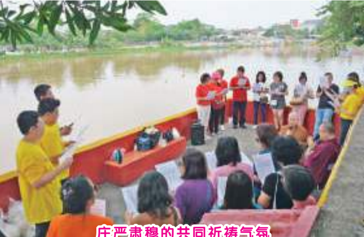
庄严肃穆的共同祈祷气氛