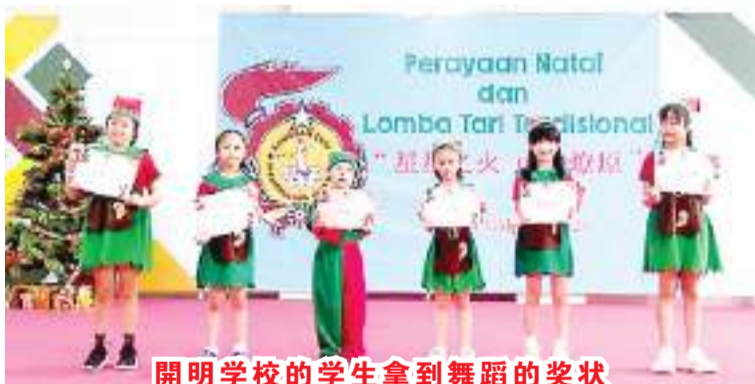
開明学校的学生拿到舞蹈的奖状