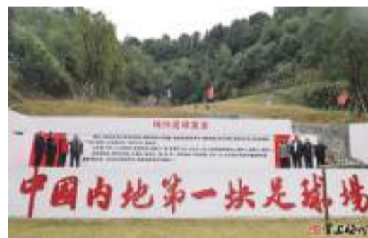
現場舉行《梅州足球宣言》揭幕儀式。