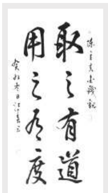
江春书法作品 取之有道,用之有度

“却顾所来径,苍苍横翠微。”不论形势如何变化,中美和平共处的历史逻辑不会变,两国人民交流合作的基本愿望不会变,世界人民对中美关系稳定发展的普遍期待不会变。当前,中美关系正处在新的十字路口,中美双方应本着对历史、对人民、对世界负责的态度,认真落实两国元首达成的重大共识和成果,以实际行动推动中美关系稳定、健康、可持续发展。