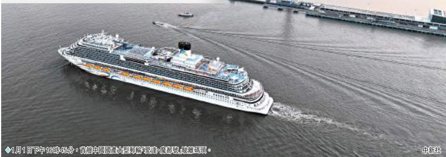
◆1月1日下午16時45分，首艘中國國產大型郵輪「愛達·魔都號」駛離碼頭。

香港文匯報訊（記者 夏微 上海報道）2024年1月1日，國產首艘大型郵輪「愛達·魔都號」正式從上海吳淞口國際郵輪港啟航，開啟商業運營。傍晚時分，三千多名來自國內外的首航乘客登船完畢，「愛達·魔都號」鳴笛啟航。船員與首航客人向岸邊揮手致意，共同開啟7天6晚到訪韓國濟州、日本福岡和長崎等地的郵輪之旅。