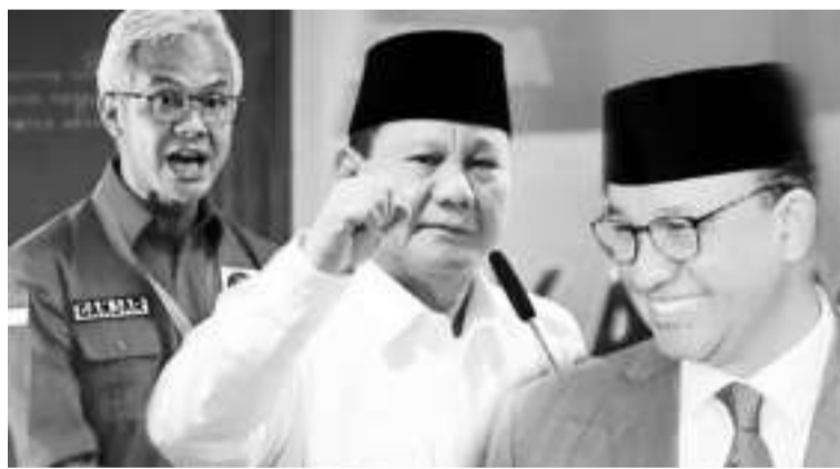
左起:甘贾尔、普拉波沃、阿尼斯。

【本报讯】根据2023年11月29日至12月4日罗盘报研发部调查报告,三号总统候选人甘贾尔的可选性明显暴跌,远远落后于其竞争对手二号总统候选人普拉波沃。调查显示,总统候选人(无搭档)的可选性版图由普拉波沃主导,占39.7%,其次是甘贾尔为18%,阿尼斯为17.4%。