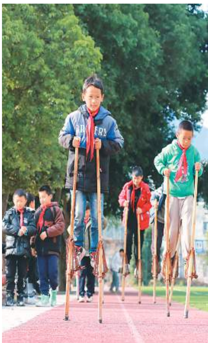
不久前，贵州省黔东南苗族侗族自治州从江县刚边壮族乡中心小学的学生，在课间活动中踩高跷。