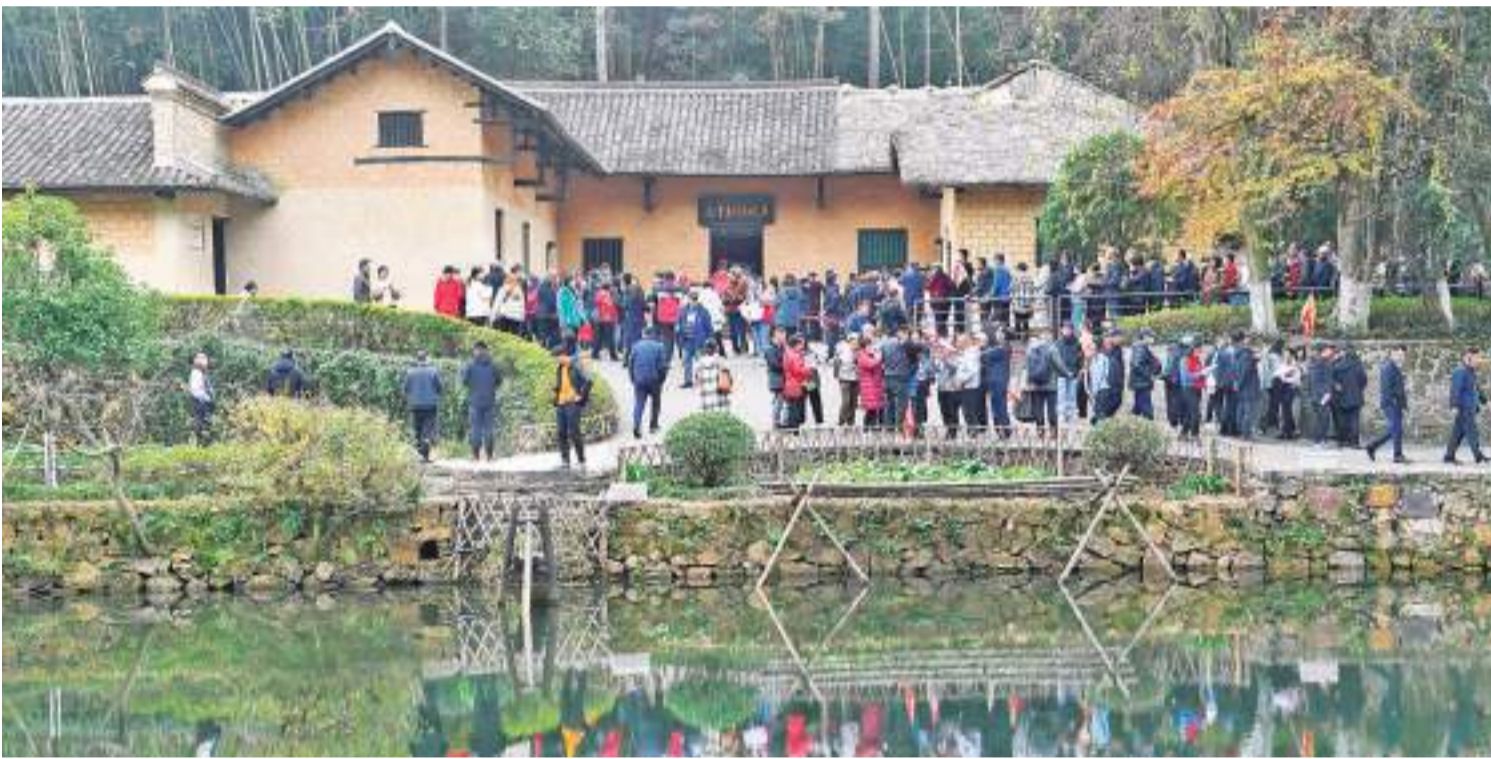
12月14日，游人在韶山毛泽东同志故居参观。

邮票图案运用数字绘画实现传统绘画的视觉表现，生动还原了毛泽东同志伟岸的形象和伟大的气魄，展现出毛泽东同志运筹帷幄的雄才伟略和高瞻远瞩的伟人风范。