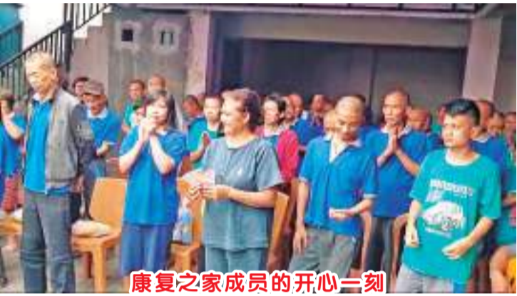
康复之家成员的开心一刻

(Rumah Kasih Panorama)和老人、儿童一起唱圣诞歌曲,分发爱心礼包等,和老人儿童过一刻美好欢乐的时间。看到老人,儿童脸上绽放的笑容,让每个队员都十分开心。再次证明“施比收更为有福”当我们无偿地献上爱心,我们也收获了喜悦。(雪妮报道)