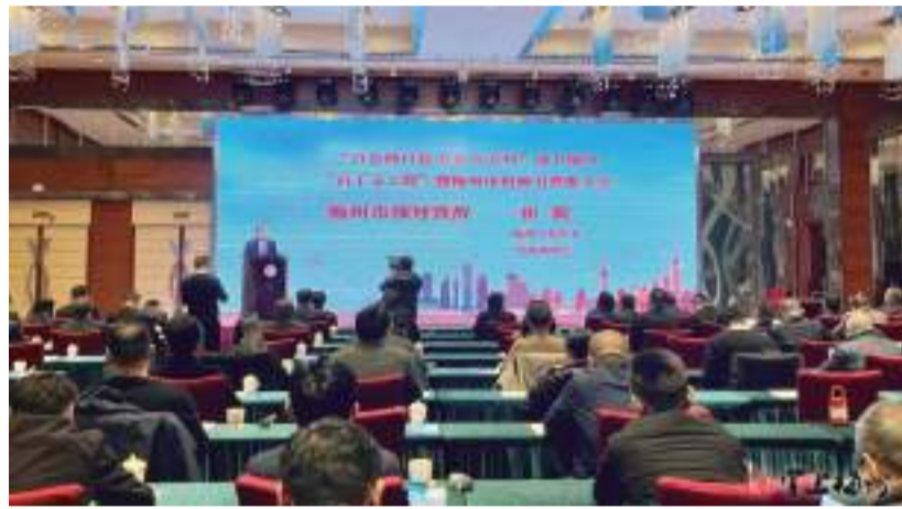
市委常委、統戰部部長崔毅作招商推介。

(掌上梅州訊)12月19日,“百會助百縣 萬企興萬村”助力梅州“百千萬工程”暨梅州市招商引資推介活動在梅城舉行,來自廣東省各地市近80家商會會長、秘書長集聚一起,共話梅州機遇,共謀發展良策。