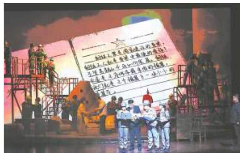
《炉火照天地》演出中