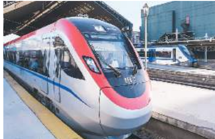
中车四方股份有限公司为智利研制的电力内燃双动力动车组近日在智利投运。该动车组最高运行时速160公里，是目前南美洲最快的轨道列车。图为动车组停在圣地亚哥中央车站。

培树健康家庭典型。到2025年末，100%的村（社区）至少有一个健康家庭典型；到2030年末，100%的村民小组（网格）至少有一个健康家庭典型。