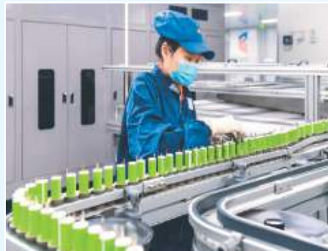
图为在江西华立源锂电科技股份有限公司生产车间，工人正在赶制锂离子电池。