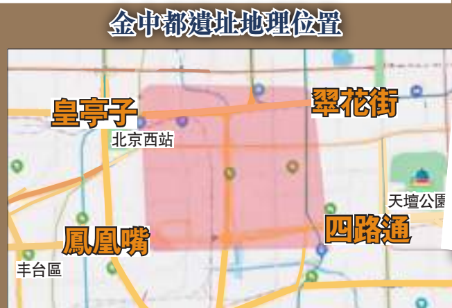
金中都遺址地理位置