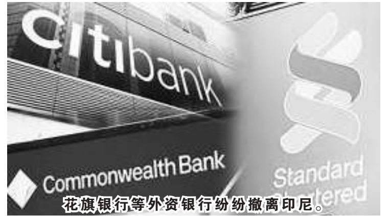
花旗银行等外资银行纷纷撤离印尼。