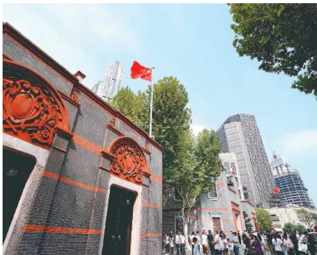
▲ 人们在上海中共一大会址参观。