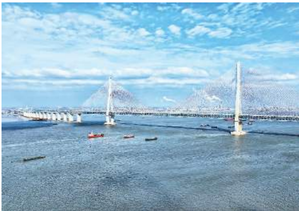
中国内河航运建设稳步推进,运输服务质量持续提升。长江沿线省份依托区位优势,着力打造“黄金水道”,推动沿江地区高质量发展。图为货物运输船舶有序行驶在长江江苏省张家港段。