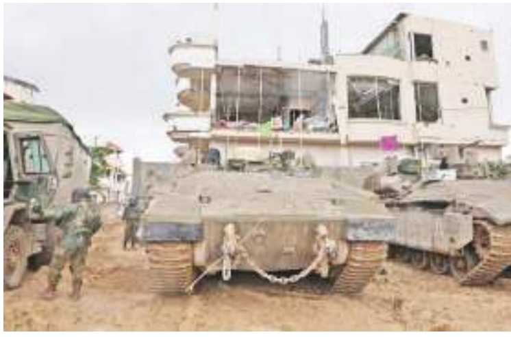
1月11日,以军部队在加沙地带展开行动。