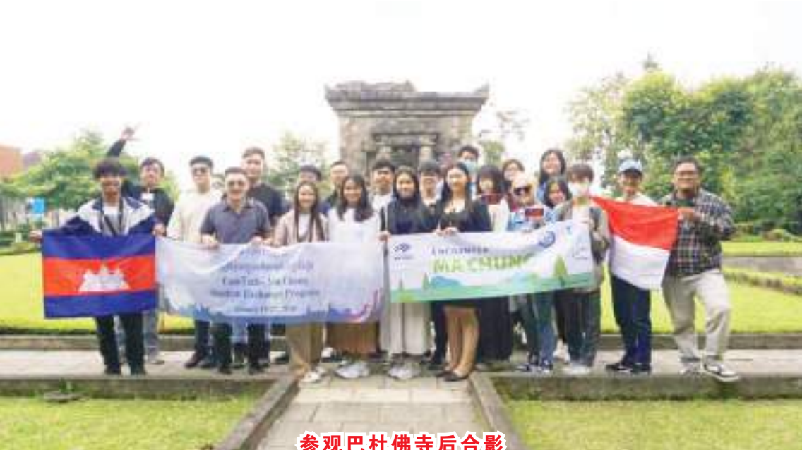
参观巴杜佛寺后合影