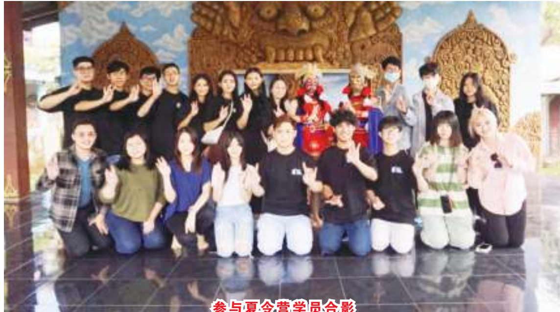
参与夏令营学员合影