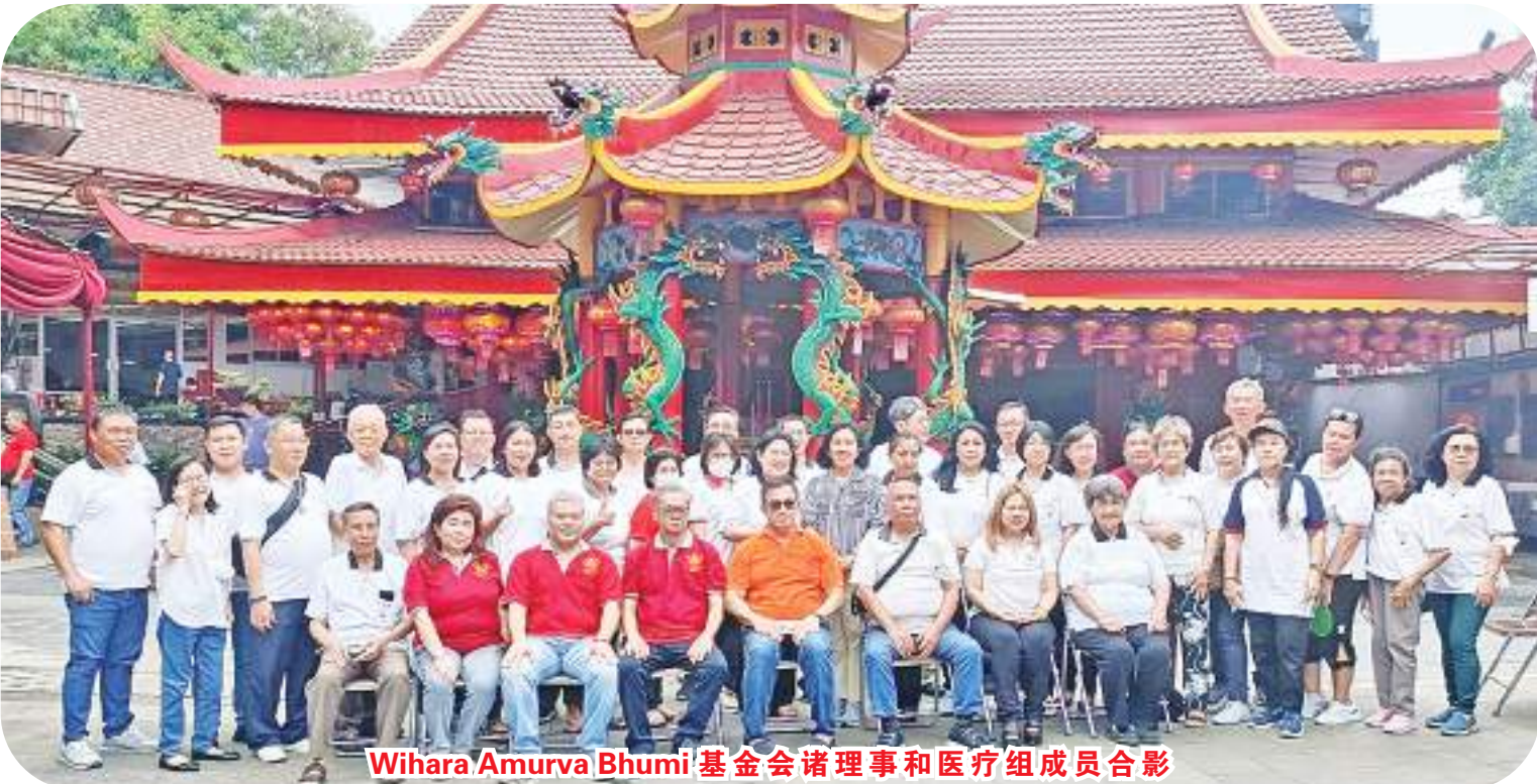
Wihara Amurva Bhumi 基金会诸理事和医疗组成员合影

【本报讯】1月21日,坐落于雅加达 Karet Semanggi 区 Jl.Prof.Satrio No.2 的 Wihara Amurva Bhumi 与 Yayasan Setia Bhakti Lestari 联合举办了一场大型慈善公益活动。除了向当地贫民派发了1200份日用必需品外,另设有免费