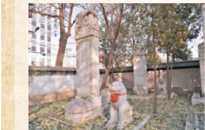
▲▼金中都城遺蹟附近的文物。