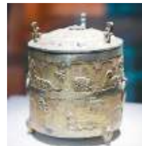
▲胡传温酒樽。山西博物院藏