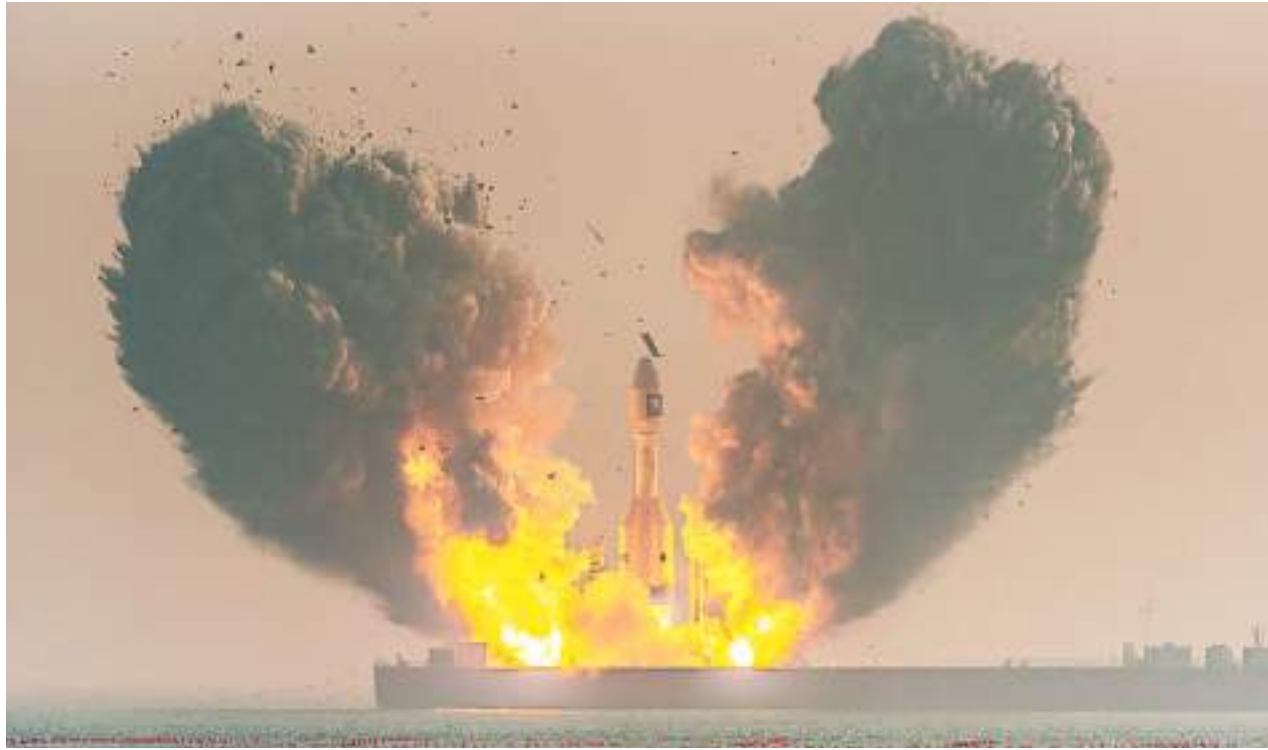
引力一号点火发射。

这型引起广泛关注的火箭就是由中国商业航天新锐东方空间科技有限公司(简称“东方空间”)制造的引力一号。近日，本报记者赶赴山东烟台东方航天港，现场近距离见证了引力一号火箭发射升空场面和卫星发射入轨的过程，并就该型火箭的特点等进行了采访。