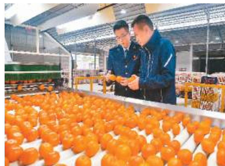
眼下，正值沃柑采摘时节。在“中国沃柑之乡”广西壮族自治区南宁市武鸣区，为精准解决农企涉税问题，国家税务总局南宁市税务局聚焦农企涉税需求，积极开展税收宣传和辅导，用“真金白银”的惠企红利，助力“武鸣沃柑”走出广西、走出国门，为当地水果特色产业高质量发展注入新动力。