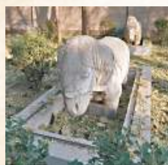
◆金中都城遺蹟附近的文物。

香港文匯報訊（記者 馬曉芳 北京報道）北京建都870周年國際學術研討會早前在京舉辦，多位專家現場分享了金中都遺址發掘的最新進展。專家們認為，金中都遺址發掘出的金中都外城牆、馬面、護城河、順城街道路等為認識北京城市變遷提供依據，實證了北京從城到都的轉變。金中都城遺址公園對外開放2.6公頃，將文物展示、文化傳承與現代生活融合，全民共享文物保護成果。在金中都城遺蹟鳳凰嘴，專家們感嘆「一眼八百年」，期待文物遺蹟被更好保護利用，讓後人現場感受中華歷史文明的源遠流長。