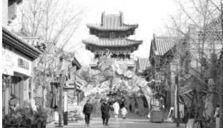
1月21日,游客在甘肃省兰州市七里河区老街游览。

春节临近,各地张灯结彩。人们逛花市、赏花灯、置办年货,年味渐浓。