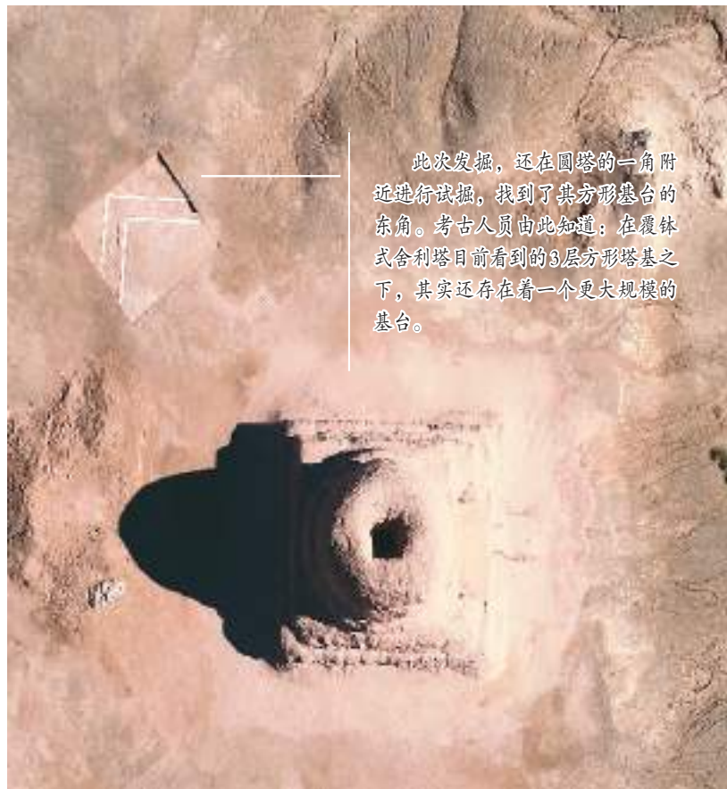
此次发掘，还在圆塔的一角附近进行探掘，找到了方形基台的东角。考古人员由此知道：在覆钵式舍利塔目前看到的3层方形塔基之下，其实还存在着一个更大规模的基台。

莫尔寺中的圆塔位于遗址中心，保存相对完好。这座覆钵式舍利塔，由3层逐渐缩小的方形塔基、塔基上的圆盘、圆盘上的圆柱形塔身和最上部的覆钵形塔顶构成。