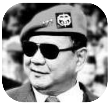
二号总统候选人普拉波沃。

【本报讯】印度尼西亚政治的鼓声越来越大，政治新闻的热议不仅在国内外媒体上，而且也挤满了外国媒体的页面。这次外媒讨论的是二号总统候选人普拉波沃的往事。