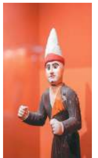
▲彩绘骆驼木俑。新疆维吾尔自治区博物馆藏