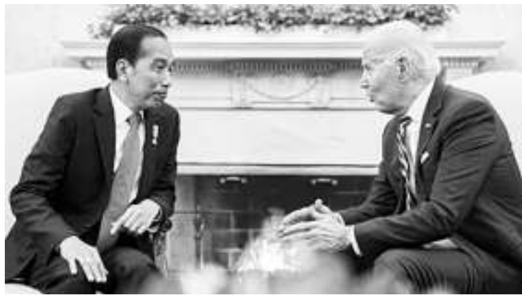
佐科维总统与拜登总统。

【本报讯】政府将我国首都从爪哇岛的雅加达迁移到加里曼丹岛的努山达拉的努力越来越认真。雅加达在被放弃其作为特别首都专区的地位后，将成为集聚区省份。这一切包含在雅加达省专区法律草案中，该草案已被国会议员同意为国会倡议的法律提案。集聚区被定义为区域规划背景下的城市地区，将多个市县区的管理与其母城市联合起来，即使与行政方面不同。