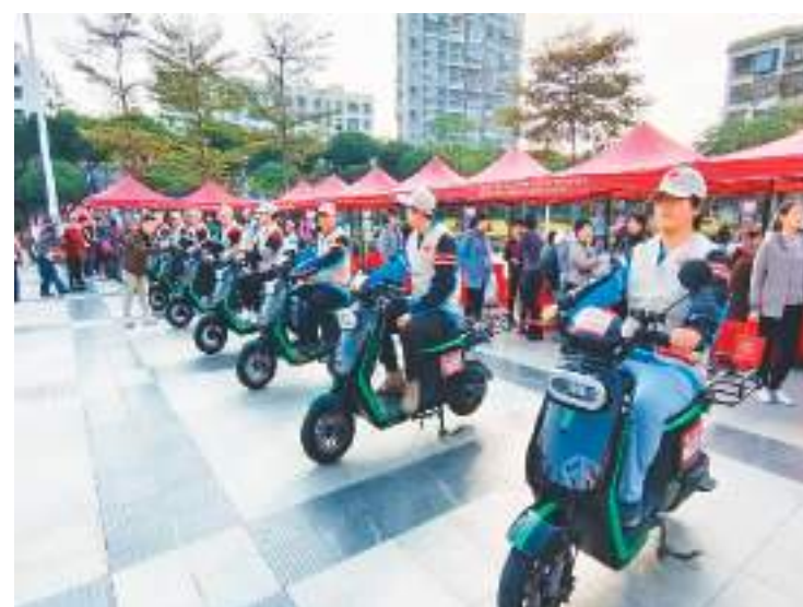
近日，由福建省厦门市红十字会、厦门市红十字基金会主办的“携手人道 温暖孤岛——2024年厦门市红十字博爱送万家”活动在厦门市举行。活动现场，厦门市首支红十字配送骑士应急救援志愿服务队成立。首批已经取得红十字救护员证的200多名配送骑士，将在群众需要帮助时，给予及时、有效的救护。图为红十字配送骑士应急救援志愿服务队。

曲靖市还通过建立回访机制，对回访不满意的本级工单，人工核实后再次交办，办理单位核实整改，推动“事事有着落、件件有回音”。