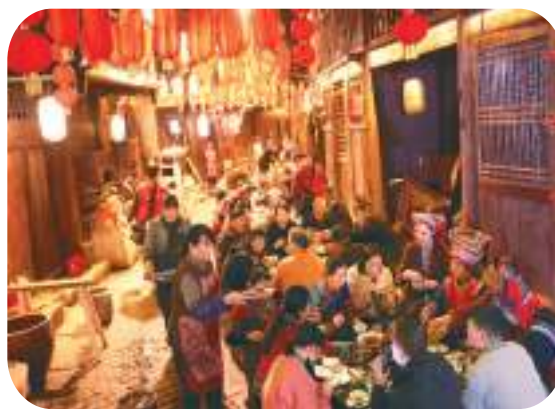
图为春节临近，湖南省永州市江永县民俗文化街年味渐浓，人们在文化街品味油茶宴。