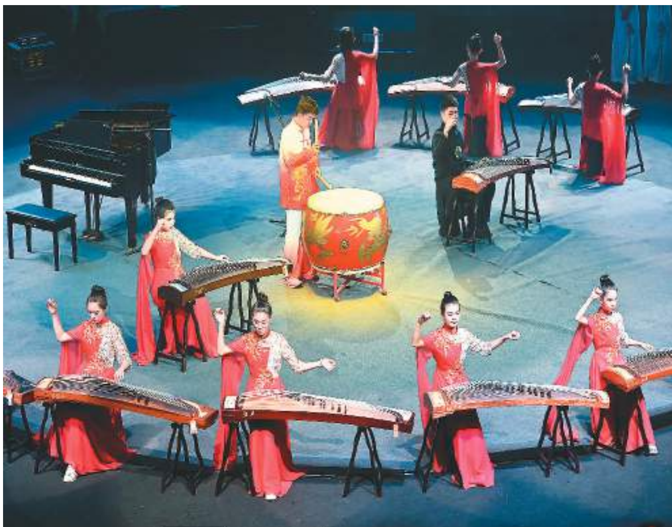
一月二十一日,第二届粤港澳大湾区青少年音乐周系列大赛颁奖仪式在大湾区各城市及北京、上海、浙江等地的一千多名参赛者晋级总决赛。图为参赛者表演节目《盛世国乐》。