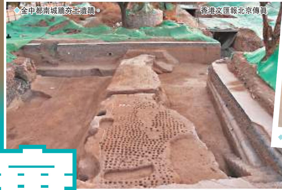
◆金中都南城牆夯土遺蹟。