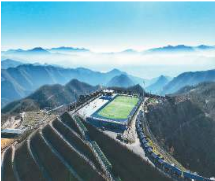
湖北省襄阳市保康县马桥镇黄龙观村在矿区修建起山顶木屋、特色民宿、高山滑雪场等旅游设施，昔日矿区化身高山特色景区，成为当地持续改善生态环境质量的一个缩影。

——战略性矿产安全保障体系建设扎实推进。自然资源部推动建立新一轮找矿突破战略行动“1+N+X”制度框架，下达“十四五”总体任务书，9个战略性矿种已提前完成“十四五”目标任务。完成矿产资源国情调查，全面摸清中国矿产资源情况。山东莱州金矿、云南昭通磷矿、四川雅江锂矿、青海柴达木盆地钾盐、湖北竹山