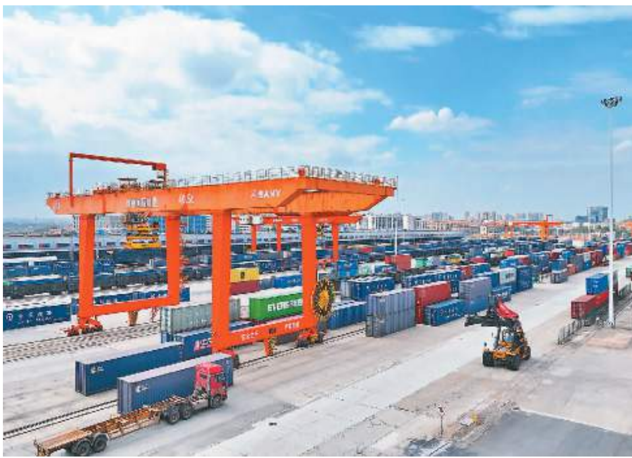
江西赣州国际陆港加快构建完善物流网络体系，带动赣南脐橙、南康家具出口外销，实现“赣品出海”。图为进出口大宗货物集装箱在赣州国际陆港货运站有序装卸。