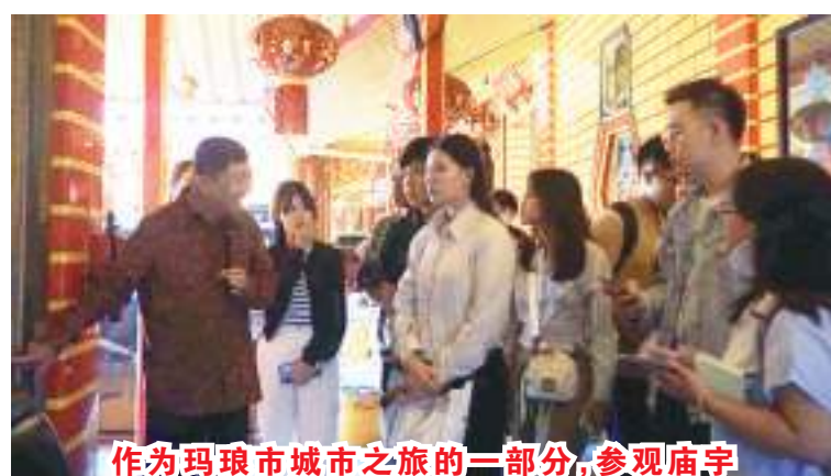
作为玛琅市城市之旅的一部分，参观庙宇

此之外，此计划也旨在介绍玛中大学，加强合作伙伴之间的合作。” 他指出，“就国际关系而言，这符合我们大学的精神。我们非常鼓励我们的学生主动尝试出国，在