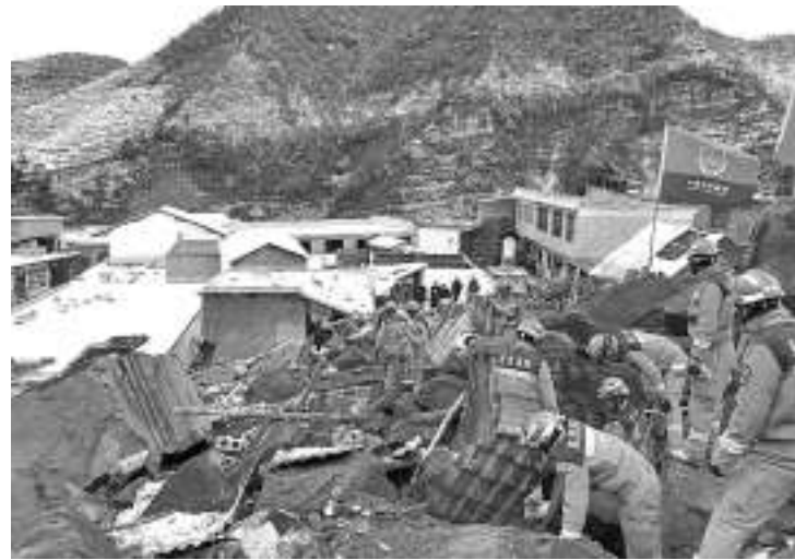
1月22日在云南省昭通市镇雄县塘房镇凉水村拍摄的救援现场。

根据习近平指示和李强要求,中共中央政治局委员、国务院副总理张国清已率工作组赶往云南现场指导搜救工作,自然资源部、应急管理部已启动应急响应,云南省、昭通市组织力量开展救援。目前,各项工作在紧张有序进行中。