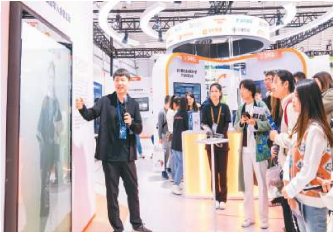
2023年11月7日，参展商在世界互联网大会上展示“超写实数字人”。

随着“Z世代”（指1995年至2009年出生的代际）用户的不断涌入，过去以“信息交流”为主要功能的社交网络开始重构，社交平台纷纷朝着新技术、新方向、新模式“破圈”。