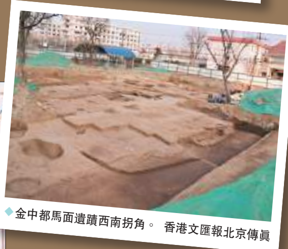
◆金中都馬面遺蹟西南拐角。香港文匯報北京傳真