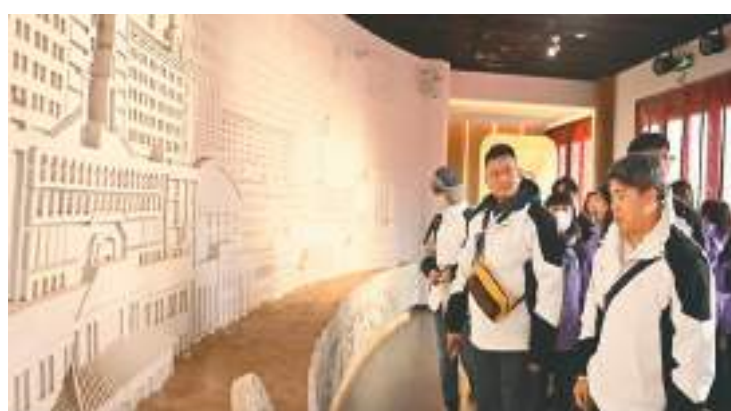
台胞青年参观兰州大学校史馆。

此次活动由中华全国台湾同胞联谊会联络部主办,甘肃省台湾同胞联谊会承办,中华青年发展联合会、中华文化经贸交流发展协会协办。