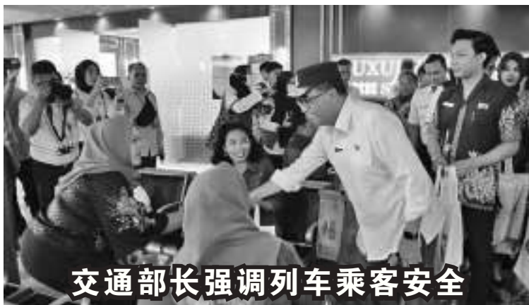
交通部长强调列车乘客安全

此前，普拉波沃在西爪哇省参加一项活动时曾向其支持者提问，食物和上网之间到底哪一个更重要？这是普拉波沃回应有关上网比午餐更重要的说法。 据了解，免费午餐是普拉波沃-吉布兰提议的纲领之一，普拉波沃于1月20日说：“因为有人说，午餐对儿童不重要，上网更重要。”(Ing)