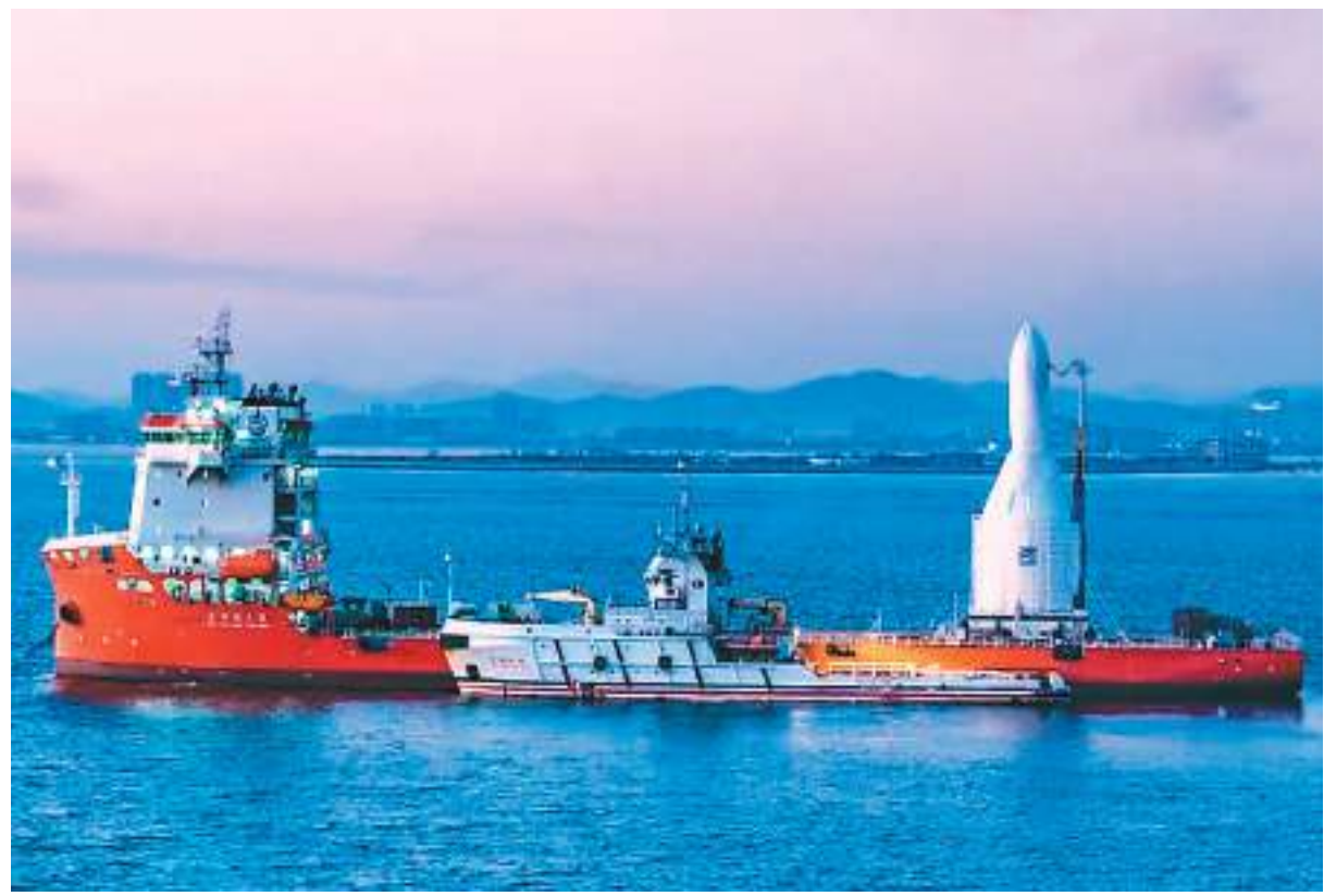
引力一号矗立在东方航天港号发射工船上，整装待发。