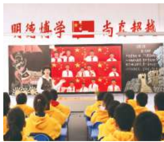
▲ 安徽省蚌埠市蚌埠新城实验学校，老师组织学生开展爱国主义主题班会。