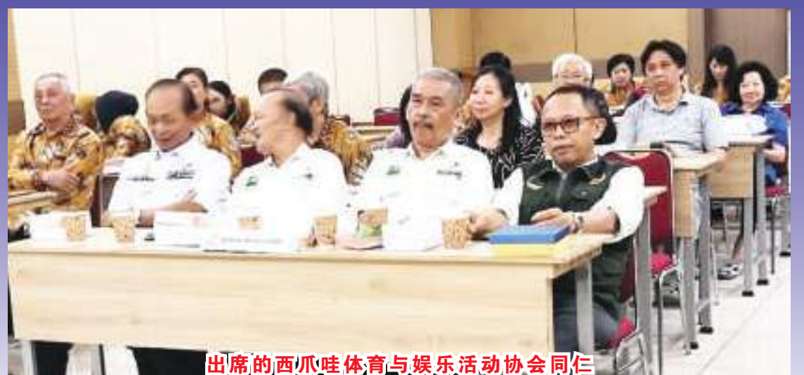
出席的西爪哇体育与娱乐活动协会同仁