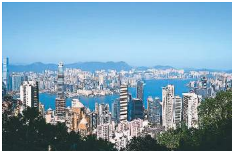
香港城市风光。

新一届区议会履新即积极作为、特区政府“抢人才”“抢企业”奋发有为、粤港澳大湾区加速融合发展……新年伊始,香港生机勃勃,特区政府和社会各界正按国家“十四五”规划和行政长官施政报告为香港擘画的蓝图大步前进。