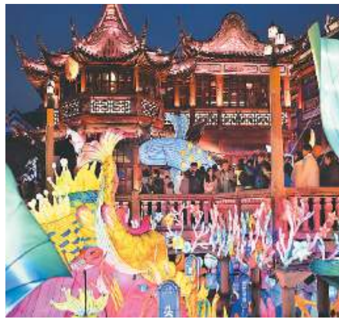
1月21日，2024上海豫园民俗艺术灯会正式亮灯。今年豫园灯会续写“山海奇豫记”，以“海经篇”为主题，生肖龙灯、海底世界、鱼群起舞、奇幻仙境等场景让人们在灯火绚烂中喜迎龙年新春。图为游客在豫园九曲桥上赏灯。