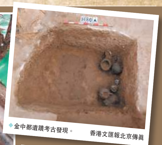
◆金中都遺蹟考古發現。