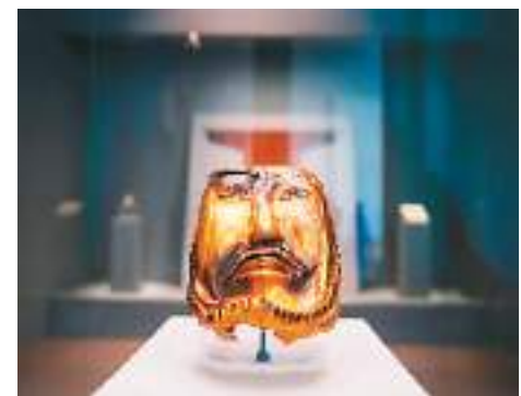
▲镶红宝石面具。伊犁哈萨克自治州博物馆藏