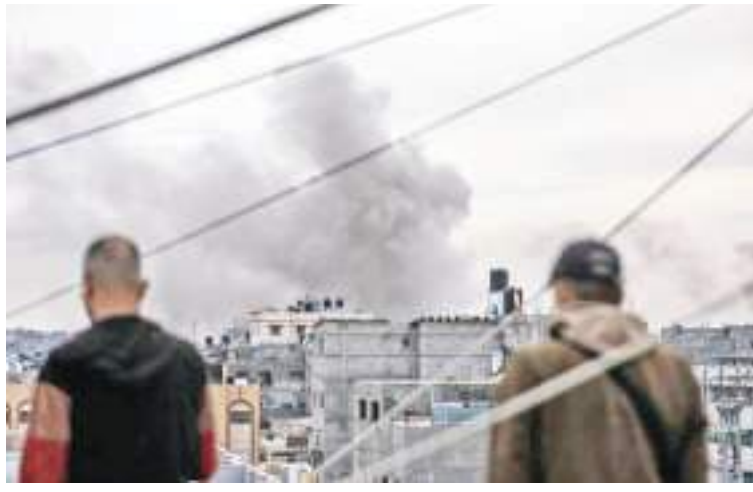
1月21日,加沙地带南部城市汗尤尼斯在遭遇以军空袭后升起浓烟。