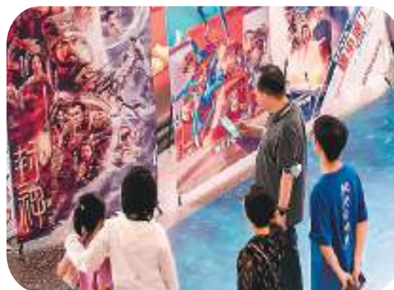
图为2023年7月，上海和平影都，市民被暑期档电影海报吸引。

2023年中国电影票房收入总额达到了接近550亿元人民币的规模，与2022年相比增长八成。与此同时，中国国产电影票房增长显著，国产片票房占比近84%，票房前十名的作品均为国产片。