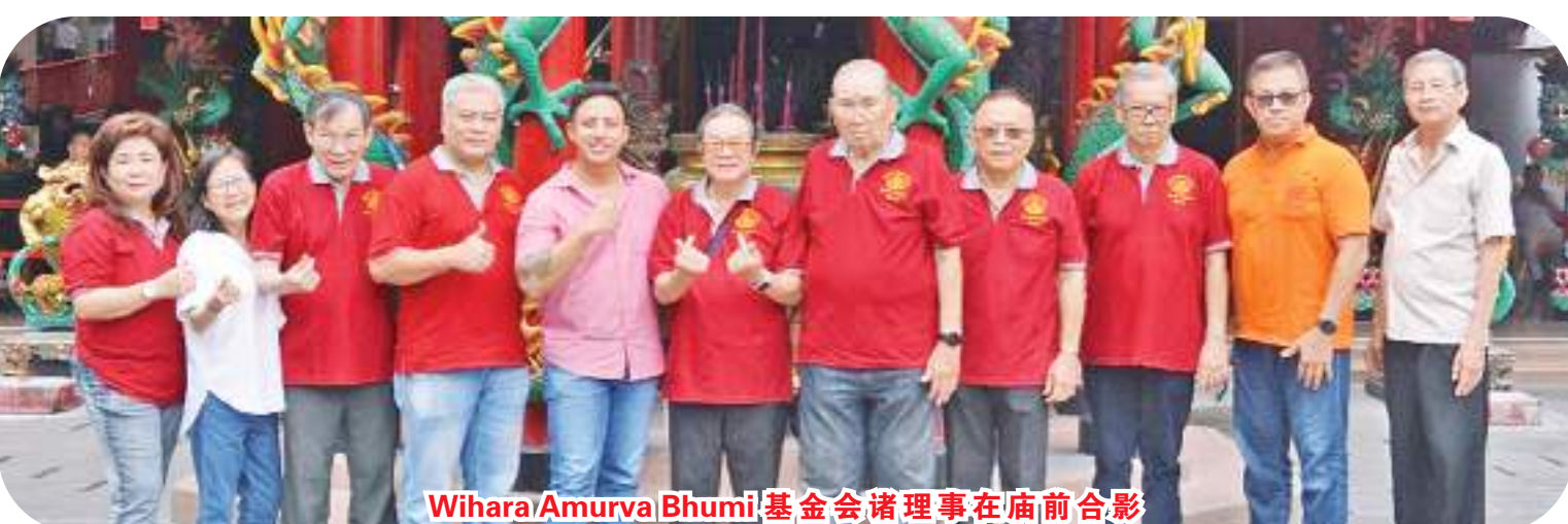
Wihara Amurva Bhumi 基金会诸理事在庙前合影