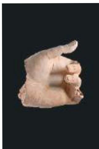
莫尔寺遗址考古出土了多种造型的佛手。