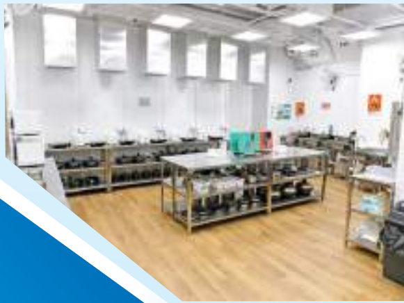
▲社區客廳共享廚房可供16個家庭同時使用。

該項目為期三年，試行一年後當局將會檢討成效，並考慮擴展至其他劏房戶較集中的社區。在首個社區客廳開幕日，政務司司長陳國基表示，希望劏房未來只用作睡覺，其他的家庭活動皆可在社區客廳舉行，把劏房狹窄環境的影響減到最低。他還透露，信和集團已承諾將在土瓜灣和紅磡等地再撥地方用作社區客廳。