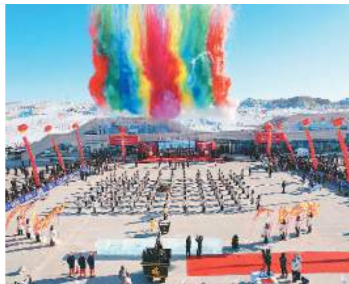
1月20日，新疆维吾尔自治区福海县第十七届乌伦古湖冬捕文化旅游节在乌伦古湖开幕，活动吸引了来自全国各地的游客。图为开幕式现场。

北京市电动汽车保有量居全国前列，其中电动公交车已超过1万辆。今年1月，首都电力交易中心有限公司跨省采购了内蒙古自治区锡林郭勒盟、乌兰察布市的3.7亿千瓦时风电和光伏电力。今年，这些绿色电力将通过电动公交场站的约1200台充电桩，为北京超过8000辆电动公交车持续提供绿色动能。经测算，此项绿电交易预计全年可减少二氧化碳约29.51万吨。