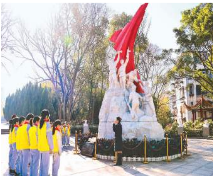
▲ 江西省赣州市天竺山小学学生在当地爱国主义教育基地参观学习，接受爱国主义教育。

文化和旅游部政策法规司一级巡视员周久财表示，文旅文物等系统下一步将持续做好革命文物等文物古迹、传统技艺等非物质文化遗产、红色资源的发掘与利用工作，“通过推动文物的活化利用和非物质文化遗产的传承弘扬，更好地传承中华优秀传统文化、革命文化。”同时，推进文化和旅游深度融合，让旅游成为人们感悟中华文化、增强文化自信、激发爱国热情的过程。