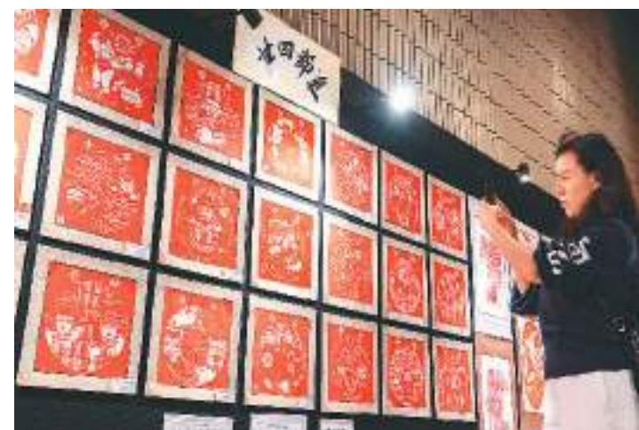
题为“寄手成春2024”的香港中国剪纸文化艺术学会剪纸作品展近日在香港文化中心展出。龙年主题、中国传统二十四节气主题等剪纸作品吸引观众前来参观。