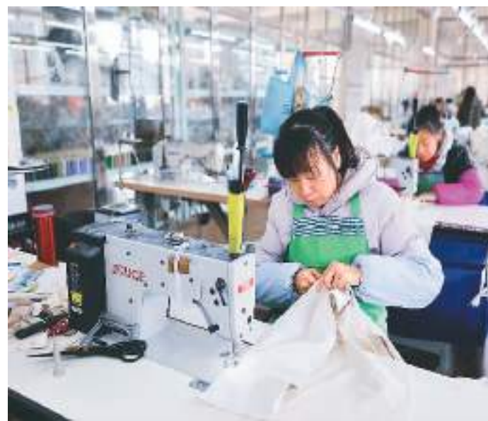
浙江省淳安县浪川乡积极发展来料加工式、电商直播式、农旅融合式、产业赋能式等形态的“共富工坊”，全面夯实强村富民产业基础。目前，浪川乡已建成“共富工坊”14家，吸纳农村剩余劳动力、低收入农户就近就业810余人。图为工人在浪川乡的芸卉服饰“共富工坊”加工服装。

近年来，江西省加快建立流域横向生态补偿机制，此前已与广东、湖南先后签订东江和珠江流域横向生态补偿协议，探索完善跨省流域省际政府间“权责对等、共建共享”协作保护机制。