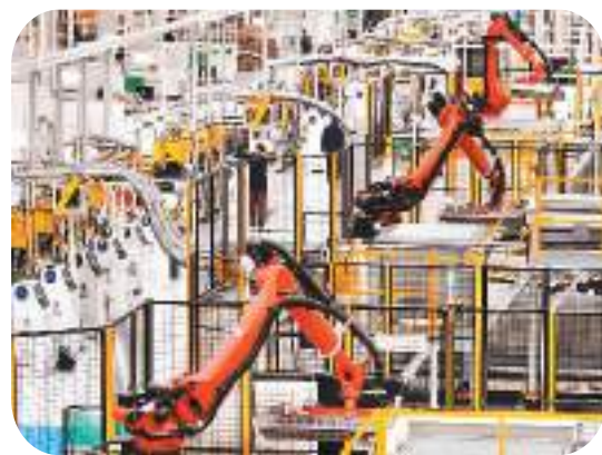
图为在江苏省扬州市江都区的一家智能制造企业，工业机器人在生产线上作业。