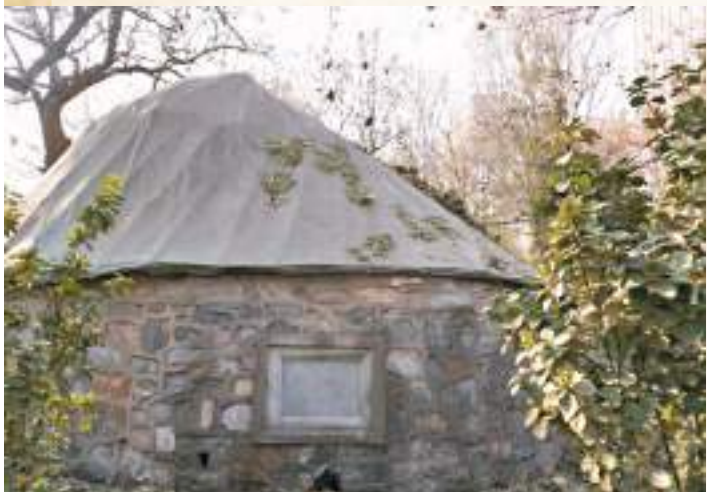
◆金中都城遺蹟。