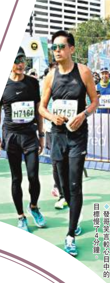
◆發哥笑言較心目中的目標慢了4分鐘。

修哥表示事前不知道家人為他搞生日會，還以為是曾孫畢業叫他預留時間不要約人，他說：「他們叫我留起下午時間，所以邊個約我都推掉，心想來跟曾孫玩下，原來又不是，結果來到好開心。」修哥笑稱其家人愛搞驚喜，之前他80歲大壽就送了個大驚喜，邀請200位嘉賓到賀，他說：「最難得是一班後生願