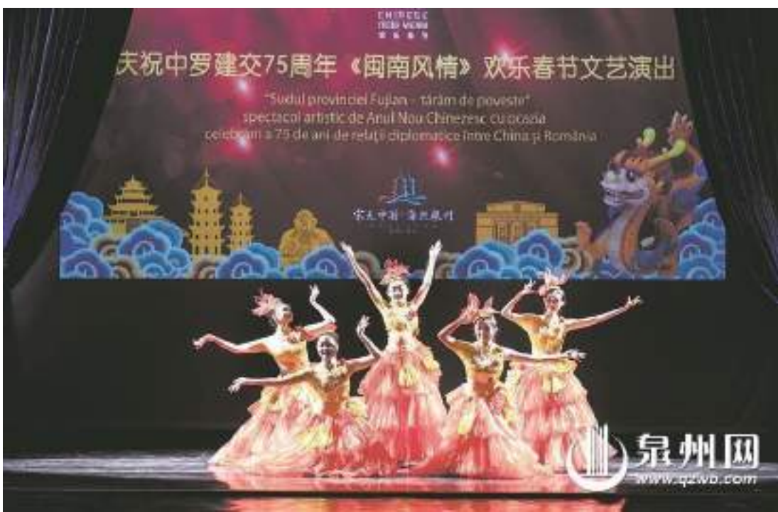
泉州網訊(融媒體記者陳智勇 通訊員曾世彬 曾曉萍 文/圖)日前,慶祝中羅建交75周年系列