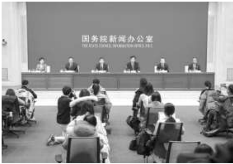
1月22日,国新办举行《关于发展银发经济增进老年人福祉的意见》国务院政策例行吹风会。

新华社沈阳2月21日电“在家里舒舒服服洗个澡,真是太好了。”患脑血栓、卧床近10年的杨德春老人在3名助浴师的帮助下,洗了个热水澡,感觉神清气爽。