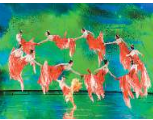
舞蹈《锦鲤》