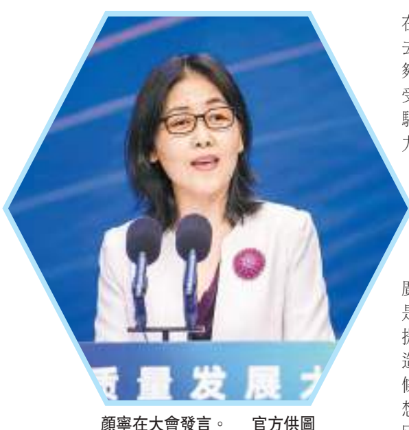
顏寧在大會上發言。

【香港商報訊】據深圳衛視新聞消息，在18日召開的廣東省高質量發展大會上，中國科學院院士、深圳灣實驗室主任顏寧在發言中表示，到了廣東才感受到春節可以為「春」，廣東、深圳的速度、力度和溫度，也讓她大開眼界。