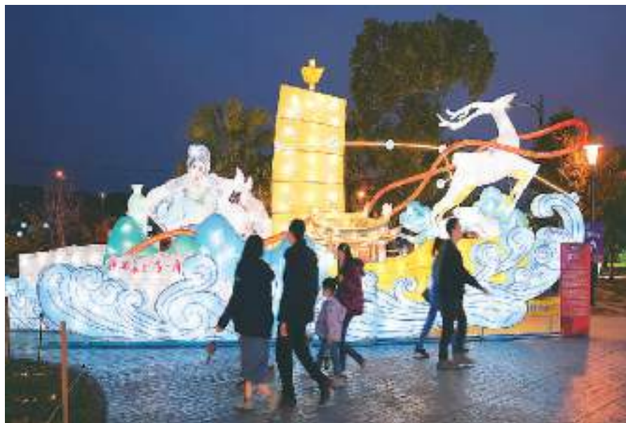
图为民众在欣赏“千年商港 幸福温州”主题花灯。

2014年以来，南投县每每举办元宵灯会时都设置大陆灯区。与南投县往来密切的浙江多个城市，更是灯会的常客。今年浙江共有12座大型花灯参展，包括杭州的“秀丽三江”、宁波的“龙耀宁波”、温州的“千年商港 幸福温州”等主题花灯，充分展现浙江各地的历史传统和文化特色。