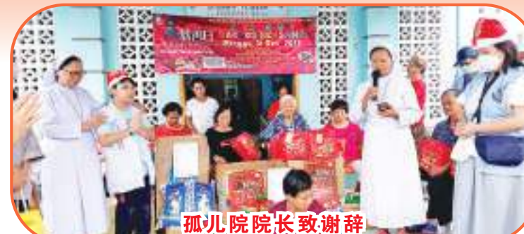
孤儿院院长致谢辞

的关怀与物资上的资助，让他们也能过上充满温情关爱的岁末年节。当天地方警察单位也派员前来关心并维持秩序，让慈善物资发放活动得以顺利圆满完成。