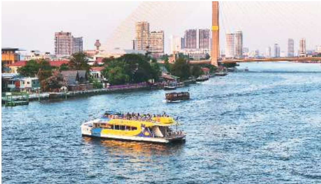
湄南河自北向南贯穿曼谷全城，河两岸分布着多项文化遗产。图为春节期间，游客乘船在湄南河上游览，感受沿岸自然风光和文化魅力。

在东南亚国家政府大力推动下，地区旅游业复苏势头强劲。从泰国的大皇官到文莱的加东夜市，从马来西亚的马六甲和文化街区到越南河内的古街商业区，人潮涌动，热闹非凡。携程的最新统计数据表示，2024年春节假期，中国游客前往新加坡、马来西亚和泰国旅游的订单量比去年同期大幅增长。浓厚的年味儿和丰富多彩的龙年庆祝活动，让东南亚成为今年春节中国游客出境游的热门目的地。