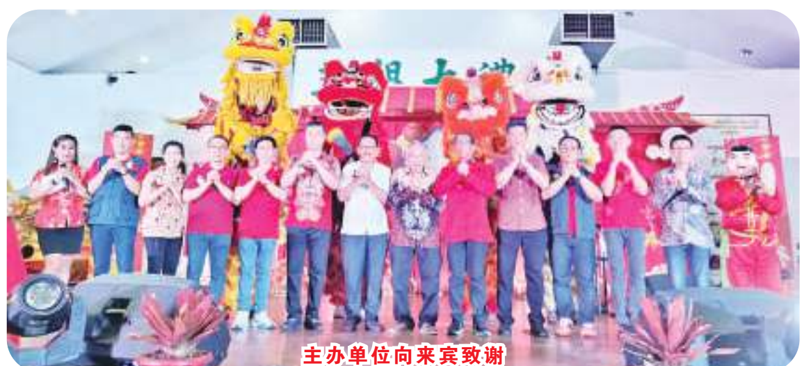
主办单位向来宾致谢