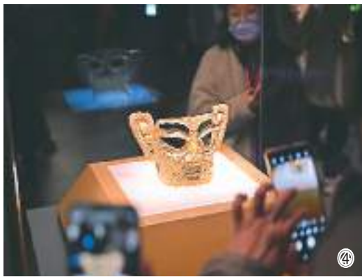
图①：2月13日，游客在河北省石家庄市正定古城南城门景区赏灯。