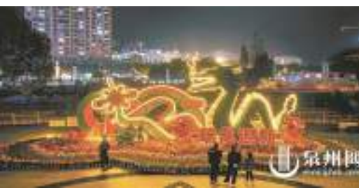
“瑞龍迎新”綠雕點綴瓷都夜色