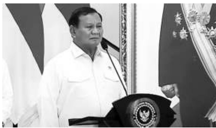
外媒关注普拉波沃。

2月20日,援引媒体的话说,普拉波沃将领导一个庞大而多样化的岛国,在全球对其自然资源的强劲需求下,其经济迅速增长,但是必须面对全球经济困难和亚洲地区紧张局势,那里的领土冲突和中美竞争迫在眉睫。普拉波沃承诺继续佐科维的现代化努力,通过建设基础设施和利用印度尼西亚丰富的资源来促进经济增长。佐科维的遗留政策包括镍,这是印度尼西亚的主要出口产品,也是其他电动汽车电池的关键组成部分,在当地工厂加工,而