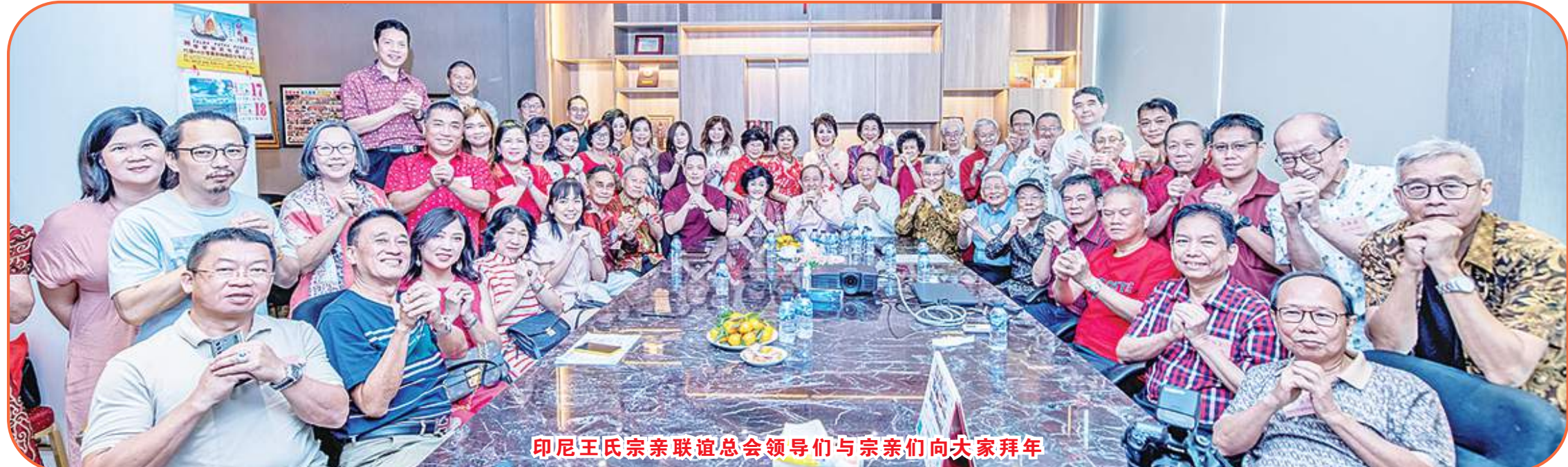
印尼王氏宗亲联谊会领导们与宗亲们向大家拜年