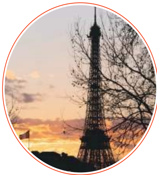
參考消息網2月20日報道——據法國《觀

點》周刊網站2月16日報道，2024年巴黎奧運會期間，預計法國將有1500萬至2000萬游客。因此，預計從7月26日到8月11日，物價將會上漲。