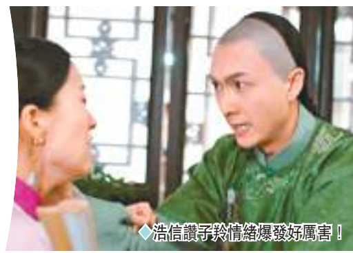
◆浩信讚子羚情緒爆發好厲害!