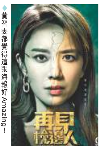
◆黃智雯都覺得這張海報好Amazing。

Mandy對於概念海報,大叫Amazing!又透露晴天與Kelly飾演的朱善美有不少相似地方,更大讚劇集具追看性。