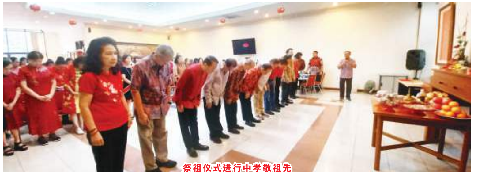
祭祖仪式进行中孝敬祖先