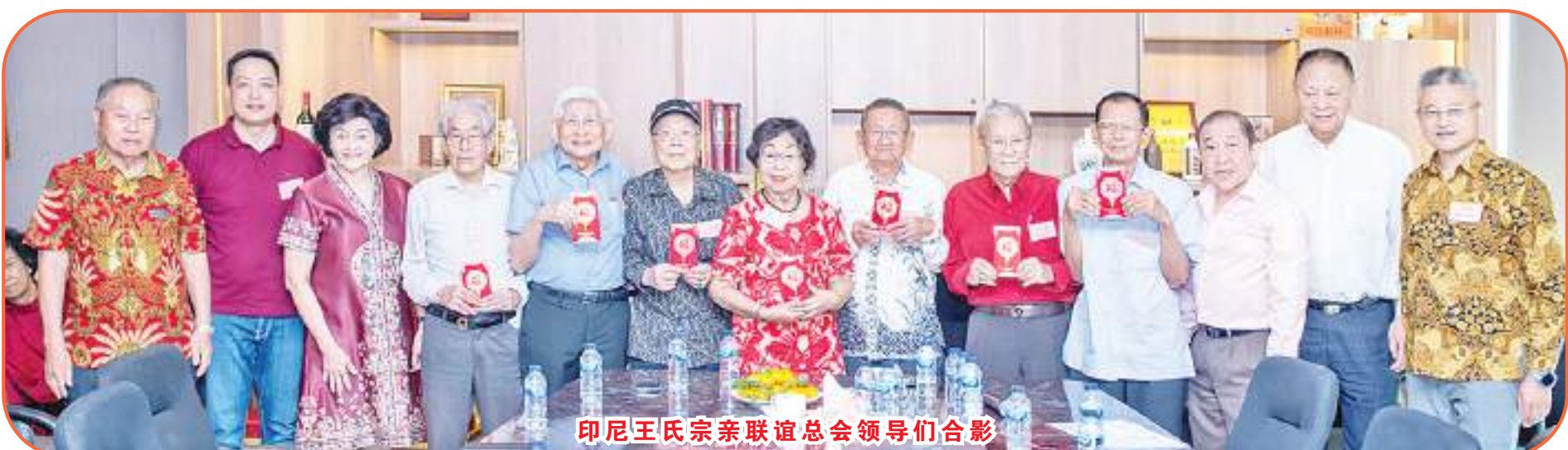
印尼王氏宗亲联谊会领导们合影

话,介绍雅万高铁的运行情况,表示开通以来运行情况越来越好。他指出印尼和中国经济互补性很强,合作空