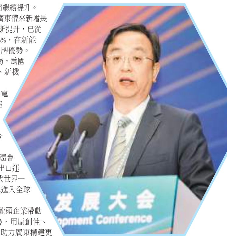
王傳福在大會上發言。

最後，王傳福現場表態，將發揮龍頭企業帶動作用，結合全產業鏈核心技術優勢，用原創性、顛覆性技術催生壯大新質生產力，助力廣東構建更加自主高效、安全穩定的產業鏈供應體系。