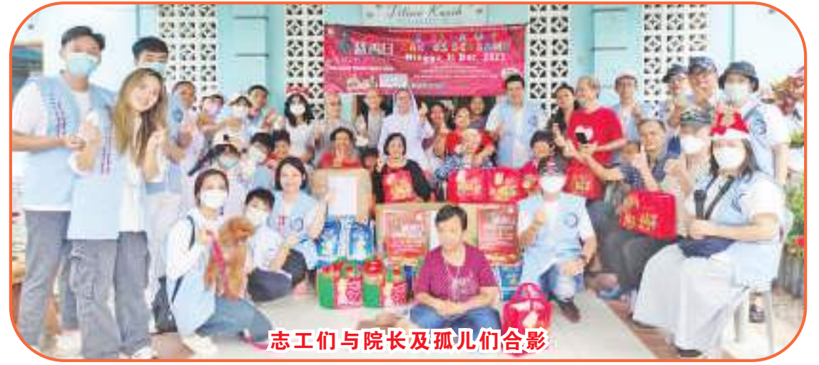
志工们与院长及孤儿们合影