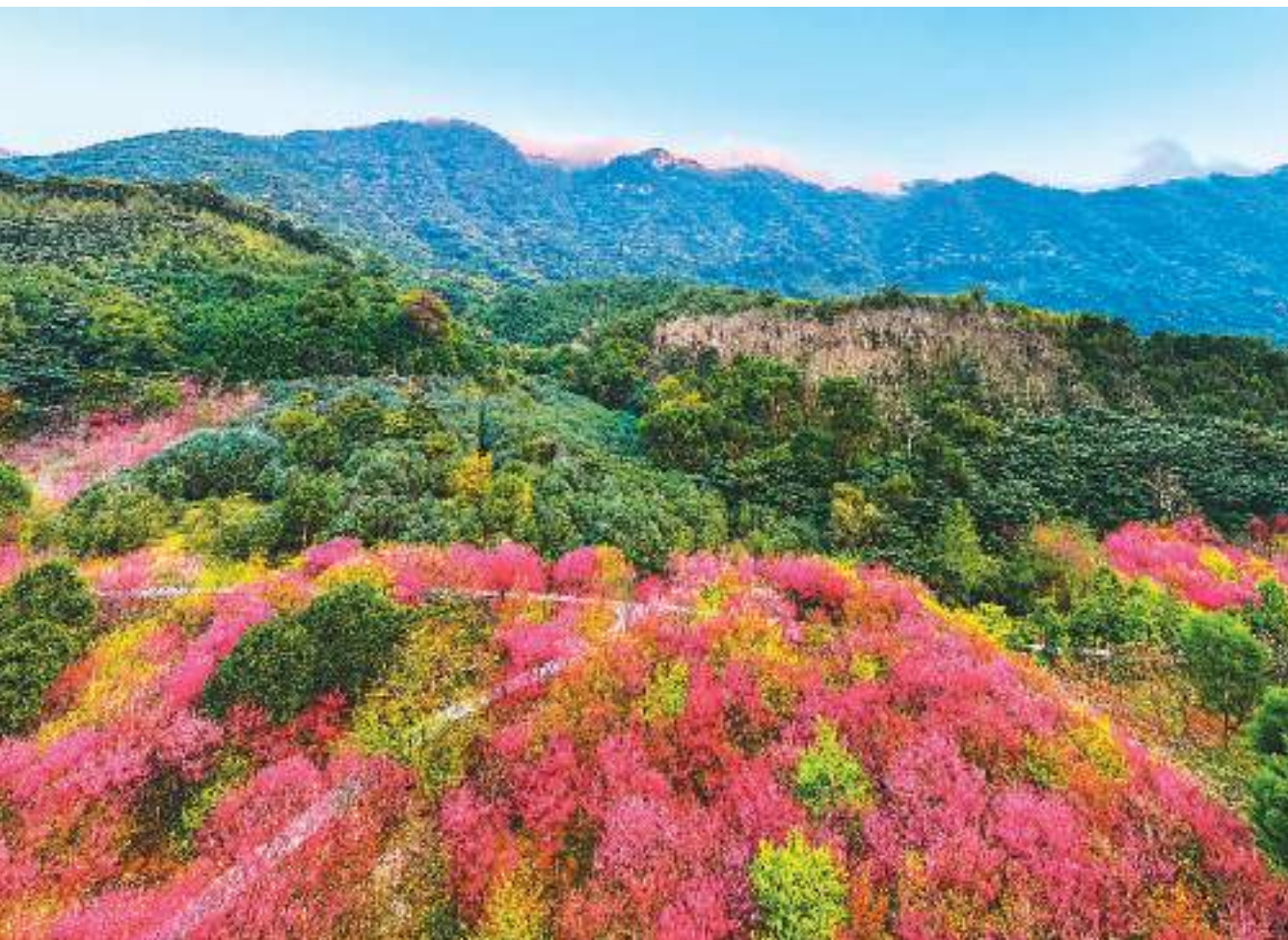
近日在福建省福清市灵石山国家森林公园，台湾山樱花盛开，景色美不胜收。