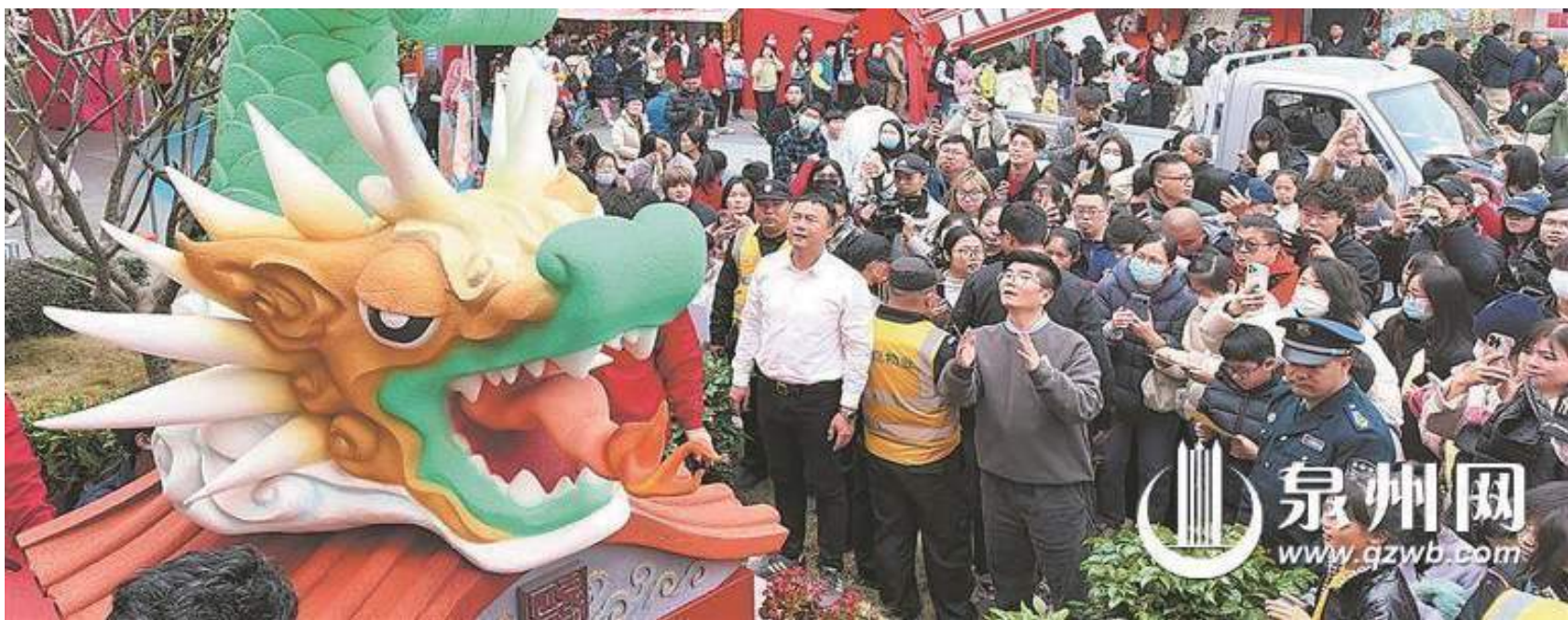
龍嘴大張、舌噴火焰的“螭吻”

甲辰龍年將至,年味漸濃。古城“十龍九子”、晉江“簪花龍”、德化“瑞龍迎新”、臺商區“必應龍”……近期,泉州各縣(市、區)的龍形裝飾很出圈,你更喜歡哪一條“龍”呢?