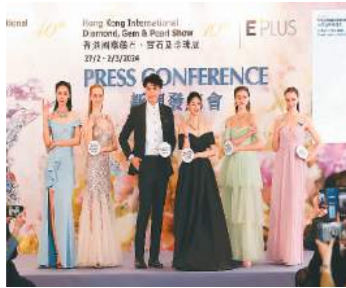
发布会现场，主办方媒体展示部分参展珠宝。

该两项珠宝展是国际瞩目的珠宝商贸平台，每届都吸引大批国际企业和买家参与。香港贸易发展局表示，已组织来自65个国家及地区、超过90个买家团到场采购。