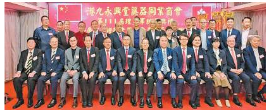
港九永興堂簾器同業商會會長與嘉賓合照。

國者治港」原則，緊密團結在港鄉親，為家鄉建言獻策，出資出力，為香港繁榮穩定、區域經濟和諧發展貢獻了力量。