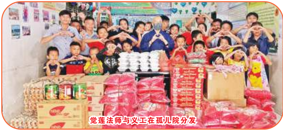
觉莲法师与义工在孤儿院分发