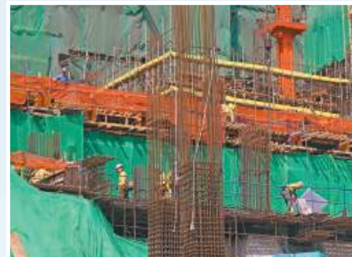
本港總就業人數減少近一萬人。 中通社

香港教育大學社會政策講座教授周基利就指，雖然移入本港人數增加，但不能忽視市民移居內地的趨勢。他表示，內地一向生活（消費）指數都低於香港，但最大阻力是醫療問題，譬如醫療券在內地更多地方可以使用，間接令香港長者在內地退休的動機更大，因此自然流出會更多。不過，周基利亦預料隨着本港經濟逐漸復蘇，加上各項人才計劃和輸入勞工等政策，未來數年本港人口總數將穩定持續上升。