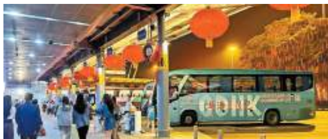
當局指內地春節黃金週(2月10日至17日)吸引約143.6萬旅客人次訪港。

李家超續說，香港正同各地城市競爭，香港有靈活多變、不斷創新的優勢，相信港人一定會再次發揮動力，創出新天地。