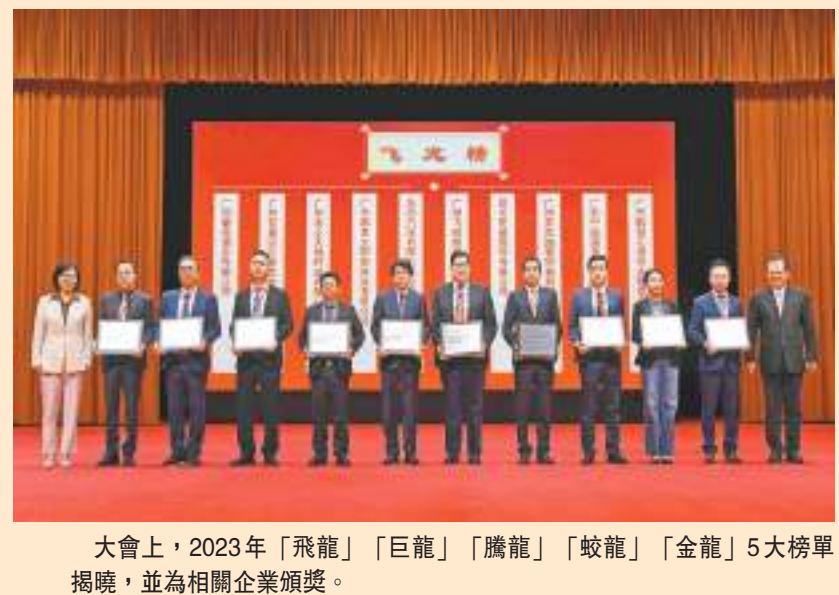
大會上，2023年「飛龍」「巨龍」「騰龍」「蛟龍」「金龍」5大榜單揭曉，並為相關企業頒獎。

生產總值增長不低於4%，固定資產投資680億元（人民幣，下同）、增長18%，工業投資170億元、增長40%，規上工業總產值增長5.5%左右，營利性服務業增長30%以上。