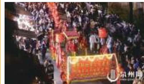
泉州網訊(融媒體記者張素萍 王柏峰 通訊員徐秋麗 文/圖)2日晚8時許,南安英都拔拔燈快閃活動亮相古城西街、鐘樓,現場人頭攢動,許多遊客加入燈隊。

游燈隊伍從泉州開元寺南大門出發,沿着西街一路巡遊,行經泉州肅清門廣場,抵達泉州鐘樓。隊伍裏的“燈首”,肩負麻繩,上身前傾,狀似拉纖,後面的人依次跟上,是為“拔燈”。“這次有30組燈隊共40人組成游燈隊伍,現場連成100米長的燈龍。”南安市英都鎮政府工作人員蘇先生介紹,相比每年農曆正月初九在英都舉辦的拔拔燈,這次過來參加的都是比較年輕的男村民,大伙積極配合。“燈龍約100米長,行進展示過程中,很多遊客主動加入燈龍隊伍,站在燈龍的右側一起拔燈。讓更多人了解拔拔燈、了解泉州民俗,是活動最大的意義!”