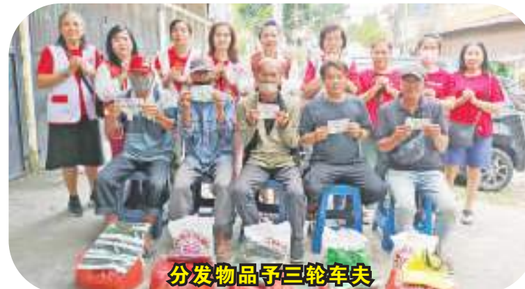
分发物品予三轮车夫