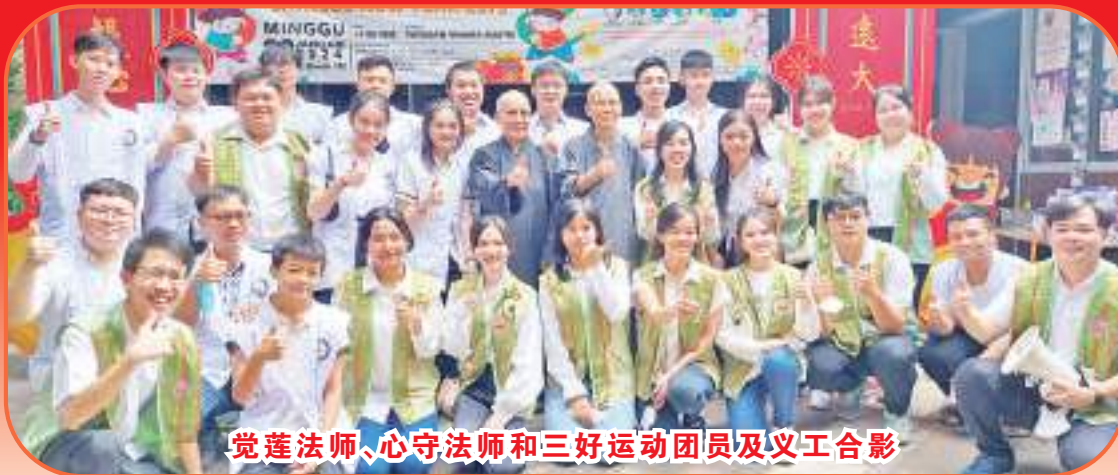
觉莲法师、心守法师和三好运动团员及义工合影