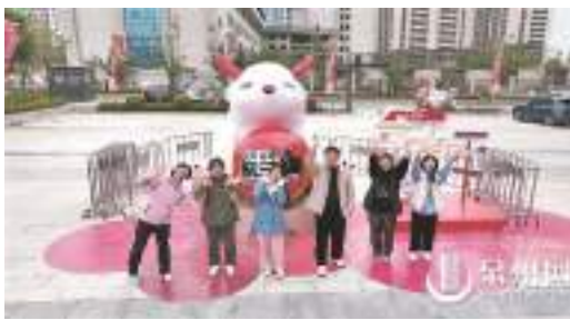
“有求必應”的“必應龍”

據介紹,英都拔拔燈是南安地方傳統民俗、國家級非物質文化遺產,其源于南宋織夫“拔船”,定型于明萬歷年間,至今已有500多年歷史。它以游燈為主題,是一種綜合民間信仰、歲時節令、民間音樂、民間舞蹈等多種文化表現形式的綜合民俗娛樂活動,表達了當地民眾盼河運平安,年豐丁旺的願望。