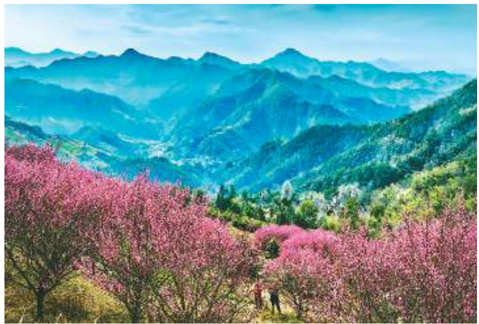
安徽省歙县霞坑镇石潭村是中国传统古村落，梅花依山就势，茂密生长，与山川、民居相映成趣，吸引游人赏梅观瀑。图为该村北山岭盛开的梅花。

在百行千业蓬勃发展的带动下，2023年大湾区经济总量预计超13.6万亿元，经济规模迈上新台阶。