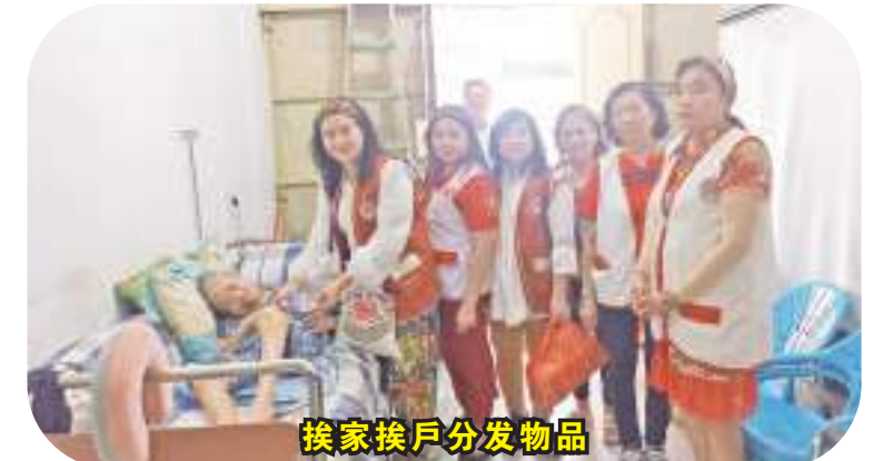
挨家挨户分发物品