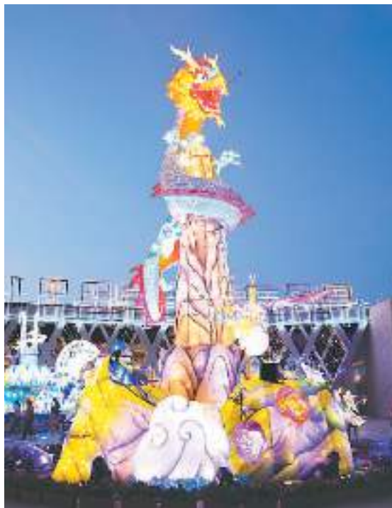
图为南投灯会“福气龙来”主灯。