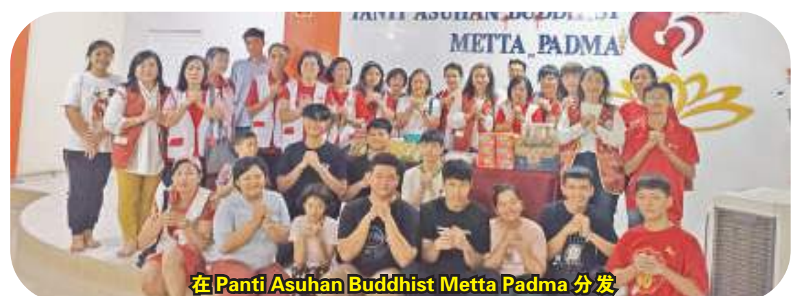
在Pantia Asuhan Buddhist Metta Padma分发