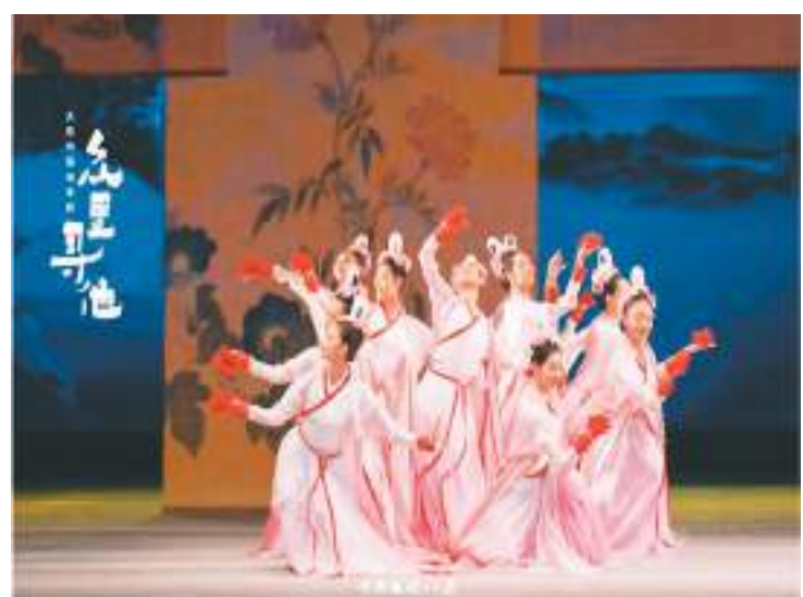
图为“四海同春”香港各界新春晚会女子群舞“元日霓裳”剧照。

节）连续两晚在红磡香港体育馆上演。主办方2月16日举行新闻发布会，介绍晚会亮点节目。