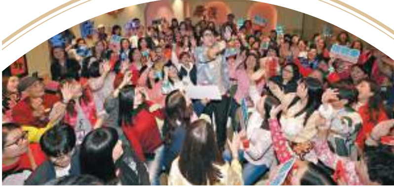
◆羅啟豪與粉絲玩得好盡興。