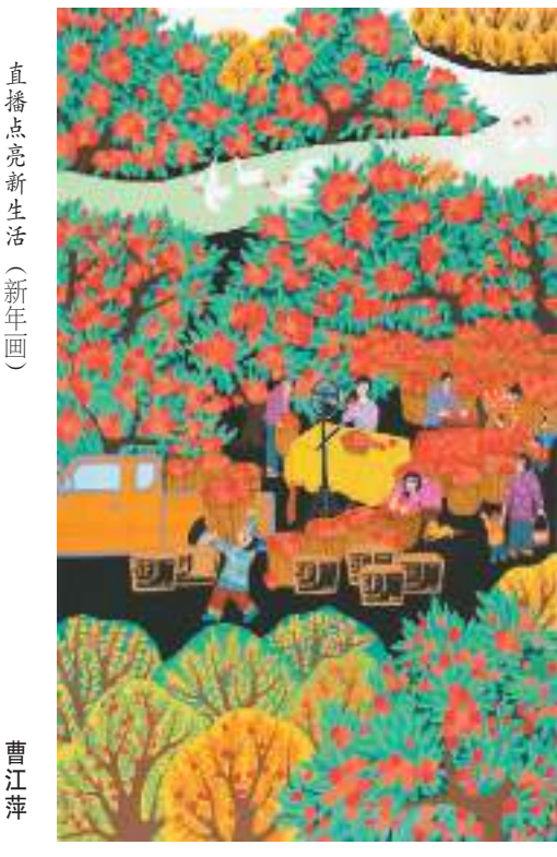
直播点亮新生活（新年画）

主办方介绍，“新生活·新风尚·新年画”——我们的小康生活美术创作展示活动自2021年举办以来，每年一届，产生了良好的社会影响。本次活动通过创作展示优秀新年画作品，丰富传统节日文化内涵，让传统春节更有年味，让人民群众精神文化生活更加充盈。