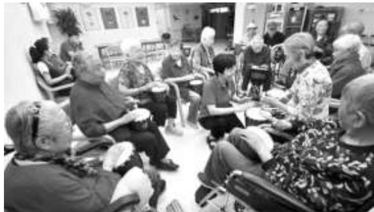
2023年5月17日,北京市朝阳区八里庄街道朝阳无限社区的老年人在社区养老驿站学习手鼓演奏。

中国老龄科学研究中心副主任袁俊武认为,发展“银发经济”既是解决今天老年人的问题,也可以为年轻人提供更多创业、就业机会,同时为社会的养老问题提供保障。