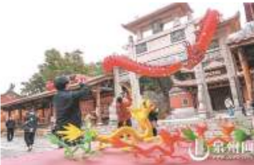
特邀蟳埔阿姨參與創作的“簪花龍”