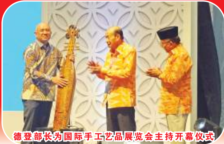
德登部长为国际手工艺品展览会主持开幕仪式