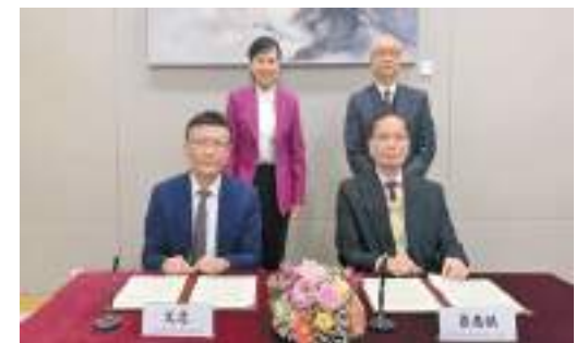
謝展寰(後排右)和張華(後排左)見證簽署《全面深化深港生態環境保護合作協議》。

【香港商報訊】記者馮仁樂報導：環境及生態局局長謝展寰率領的香港特區政府代表團，與深圳市人民政府副市長張華率領的深圳市政府代表團昨日在香港舉行港深環保合作專班會議。兩地政府總結自去年會議以來雙方的工作成果，並就未來一年的進一步合作以及相關工作交換意見。