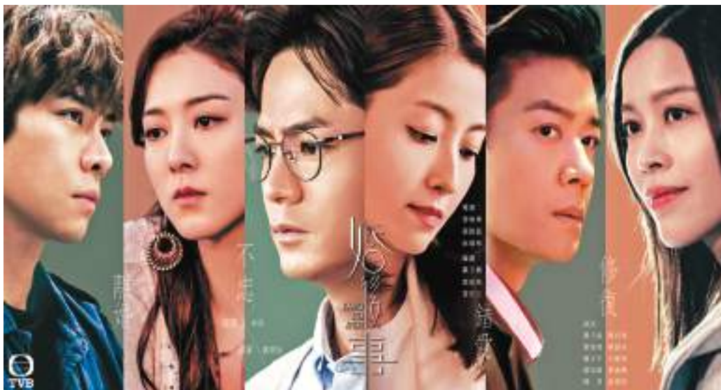
◆《婚後事》多視角的講述，讓觀眾更有沉浸感。

他覺得沒有一帆風順的婚姻，但重要的是「學習如何解決問題」，「其實我常常想，人們要上大學去深造技能，上興趣班去學習某一項愛好，為什麼婚姻這門功課，就不願意去用心學習呢？」