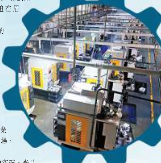
◀車間內一排排智能數控機床24小時不間斷作業。