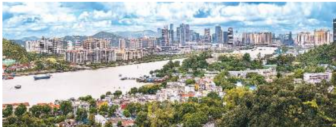
澳门（前）与珠海横琴。