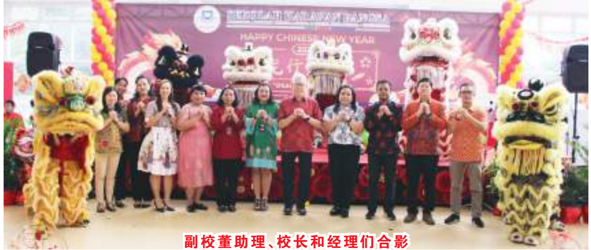
副校长助理、校长和经理们合影

观的《弟子规》。 今年的2024年木龙年庆祝活动吸引了所有学生、教师、基金会贵宾和家长们,他们热情地观看了学生们的表演。所有现代山庄民望学校幼儿园和小学的学生一直期待的活动之一就是给舞狮送“红包”,象征着给送“红包”的人驱邪避祸,给送“红包”的人带来好运。 本报记者明光报道