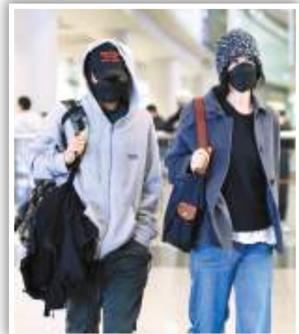
◆王菲與霆鋒結伴現身北京機場。

香港文匯報訊（記者 子棠）王菲和謝霆鋒情牽近四分之一世紀，當年的「鋒菲戀」轟動一時，而兩位當事人經歷過熱戀、分手、各自結婚、離婚後，至2014年復合。由於兩人愛得低調，甚少公開亮相。近日兩人就在北京機場被野生捕獲，據知兩人此行是到日本旅行，再齊飛回北京，雖然他們均穿便服還包得嚴嚴實實兼戴上口罩，仍被途人一眼認出。有粉絲上前向王菲索取簽名，王菲都親切答允；當粉絲跟王菲道別說了句：「姐姐再見。」王菲臉帶驚訝地跟霆鋒說：「她叫我姐姐呀！」而霆鋒的眼神就充滿寵愛。其後2人乘坐機場電動車離開時，在車上肩並肩坐着期間不時對視視悄悄話，看到有粉絲拿着一款造型特別的相機拍攝他們，王菲好奇地瞪大雙眼問是否是「寶麗來」？身旁的謝霆鋒就糾正說是「拍立得」，逗得王菲笑了起來，還嬌嗔地輕拍了一下謝霆鋒手臂，重複說是「寶麗來」，情不自禁地上演了一幕打情罵俏。