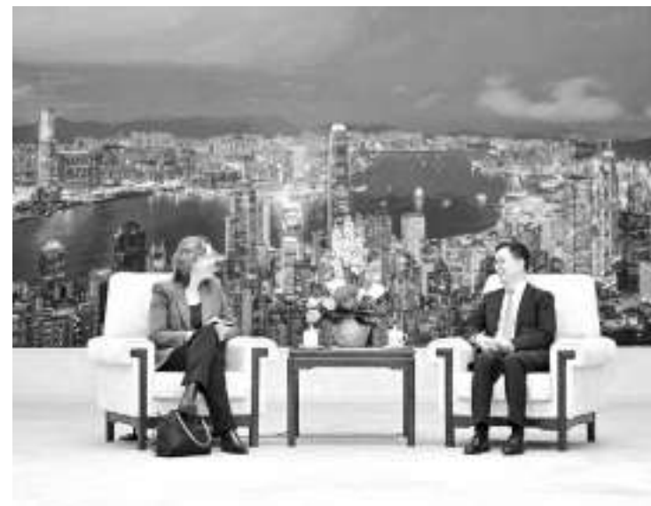
2月28日,国家副主席韩正在北京会见世界自然基金会全球总干事斯海特。

使穿梭斡旋。 “中方没有袖手旁观,没有拱火浇油,更没有从中渔利。我们所做的一切,都通往一个目标,就是为止战凝聚共识,为和谈铺路搭桥。我们将继续发挥自身独特作用,开展穿梭外交,凝聚各方共识,为推动政治解决乌克兰危机贡献中国智慧。”毛宁说。