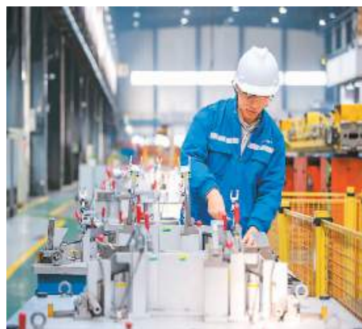
浙江省宁波市江北区大力促进汽车零部件产业集聚发展，目前江北区汽车零部件产业已集聚规上企业30多家。图为近日，工人在宁波汇众汽车车桥制造有限公司生产线上忙碌。

2024年，江北区还将打造一批行业级智能制造标志性项目，同时抓住宁波市创建国家中小企业数字化转型试点城市机遇，鼓励中小企业推动数字化改造，打造磁性材料等细分行业改造“样板间”项目，实现企业“抱团式”数字化转型。