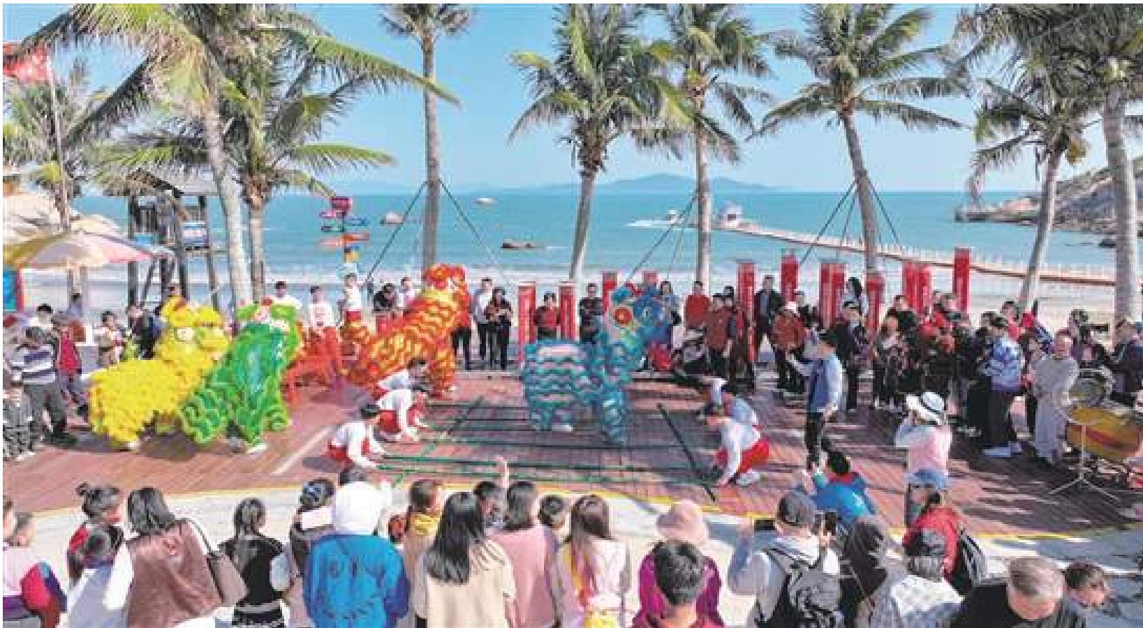
春節假期，那琴半島景區舉行舞獅等多彩活動，吸引眾多遊客前來游玩。