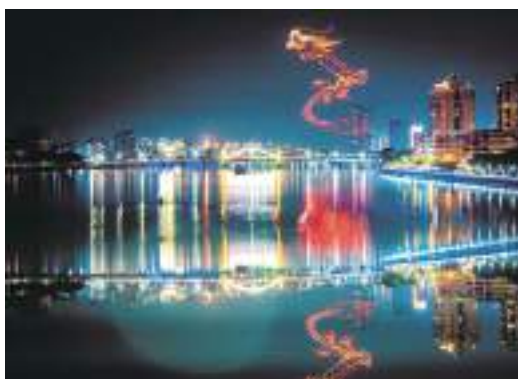
開平市2024年金龍獻瑞春節烟花無人機匯演舉行，給市民遊客帶來視覺盛宴。