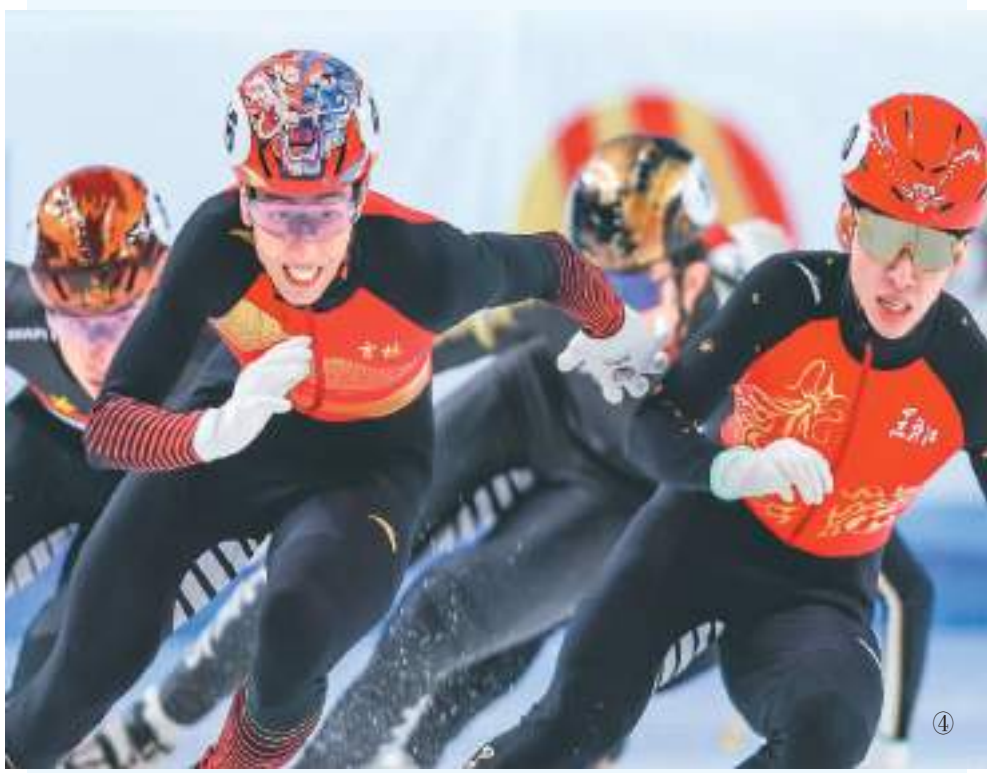
图①：参赛选手在越野滑雪公开组男子个人短距离（传统技术）比赛中。