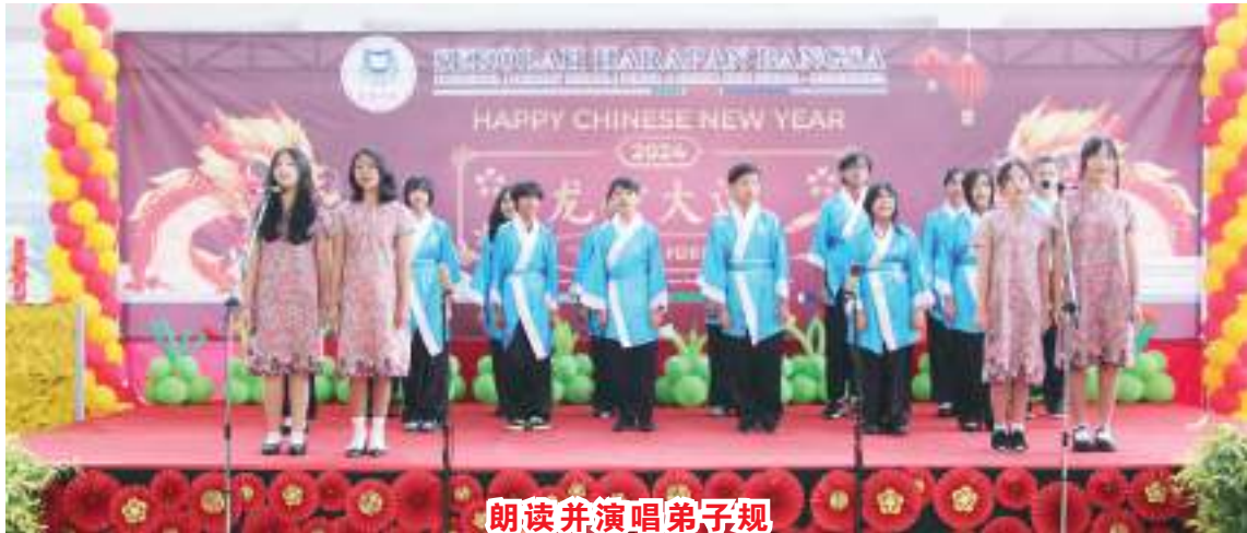
朗读并演唱弟子规