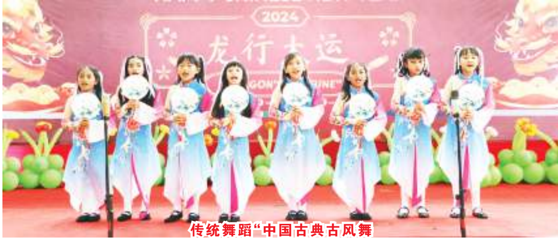
传统舞蹈“中国古典古风舞”