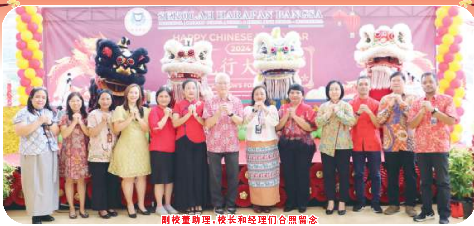
副校长助理,校长和经理们合照留念