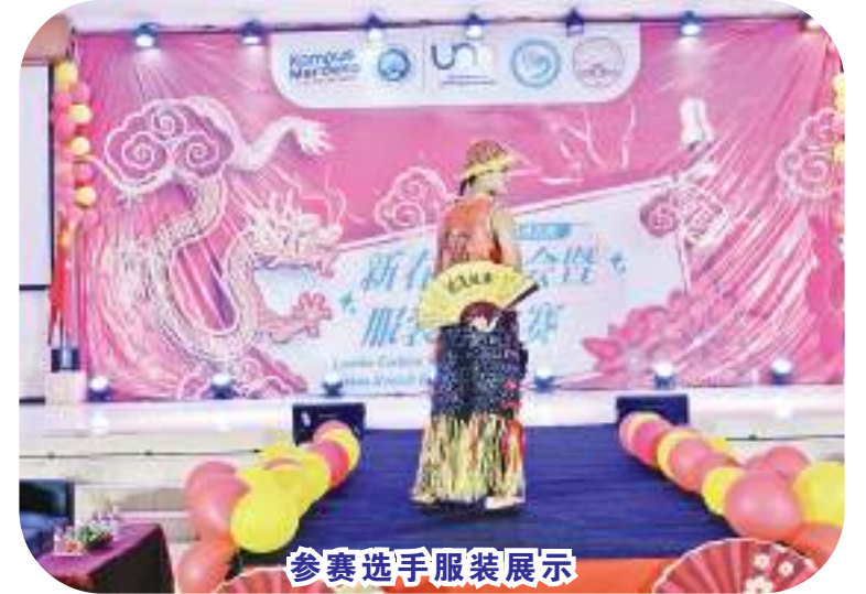
参赛选手服装展示