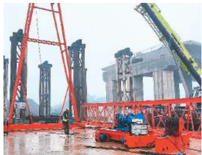
伶俐大桥项目是广西南宁市重要民生工程,大桥路线总长1.969公里,由中建路桥集团有限公司承建。项目建成后打通南宁市青秀区伶俐镇邕江南岸交通,进一步完善南宁市区域路网布局。因为项目施工现场,工人正在有序施工。

在科技人才培育方面,《措施》提到,武汉将深化顶尖人才“一事一议”引进机制,根据人才需求提供定制化支持。