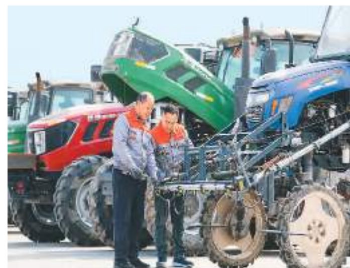
随着气温回暖,山东省乐陵市各农业服务组织、农业合作社提前谋划、合理安排,为农业生产提供农资保障、农机维修、田间管护等春季生产服务,确保春耕生产工作顺利开展,为全年农业生产开好头、起好步。图为该市来秋农机合作社社员在检修农机。

推行网上办、掌上办、多事联办、只跑一次等改革,提升审批服务效能,减少企业办事时间。二是融资更加快捷。多部门信息归集共享,为企业准确画像、开展信用融资提供了可能。深圳市市场监管局通过数据融合共享,与试点银行联合开发“个体深信贷”,服务个体工商户4.7万户,促成银行发放贷款3.78亿元,贷款利率从6%下降为4.9%,有效破解个体户融资难题,以信用赋能实体经济。三是信用奖惩更趋合理。推动涉企信息整合共享,为各部门依法履职提供数据支撑,为实施分类监管、精准监管提供坚实保障。