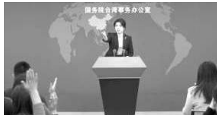
2月28日,国台办发言人朱凤莲邀请记者提问。

“福建海警在自家海域依法执行公务,维护相关海域正常秩序,保障渔民和旅客生命财产安全,执法文明,公开透明,无可厚非。”她说。 有记者问,2016年民进党上台至今,海协会和海基会联系渠道停摆,在此次事件处置过程中,两岸怎样联