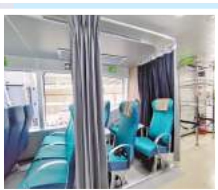
其中一艘來往中環至離島的新船。小圖為新增設的哺乳區。

素和推動環保，並提升乘客體驗。新船會提供更完備的設施，包括增設哺乳區及為攜帶寵物的乘客提供專用座位，輪椅人士專用位置亦較現有船隻增加一倍或以上，並設有無障礙洗手間，而部分座位亦增設手機充電裝置。此外，新船採用輕質物料(即鋁合金或碳纖維)建造，盡量減輕船身重量，亦會使用符合國際海事組織最高的第三級別標準的環保引擎，以減低氮氧化物的排放。