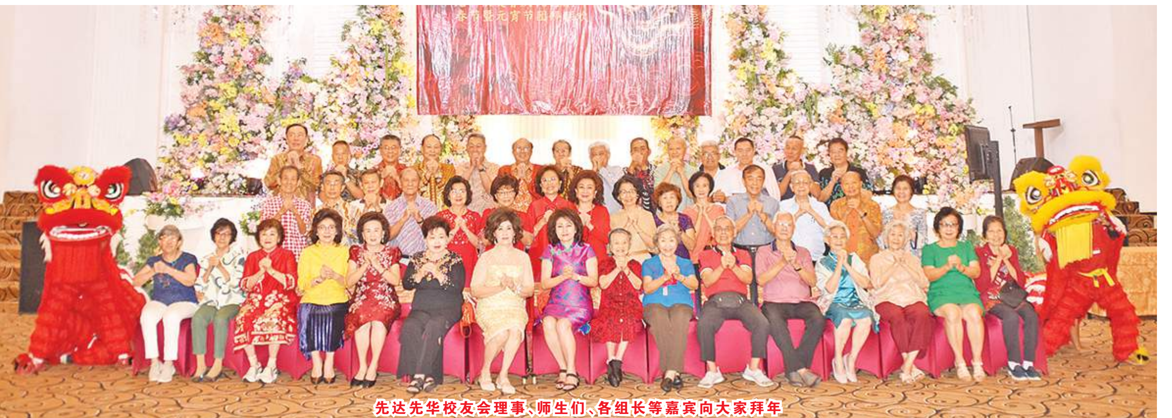
先达先华校友会理事、师生们、各组长等嘉宾向大家拜年