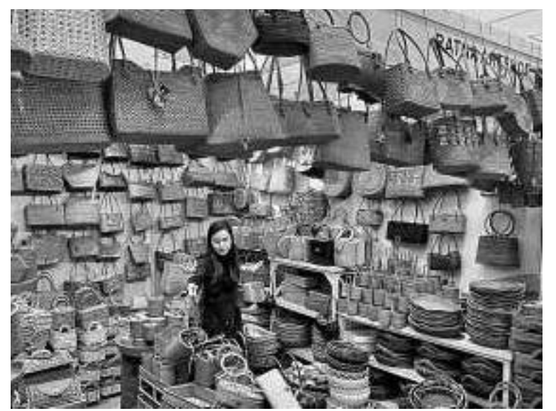
我国要成为东盟手工业出口国领头羊 图示:来宾于2月28日在雅加达议会中心(JCC)观赏其中一间手工业展览室。