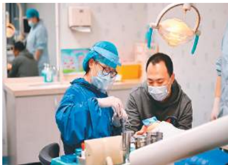
京津冀加快推进公共服务共建共享,让百姓生活更加便利。图为在北京儿童医院保定院区口腔诊室,来自北京的专家为患儿诊治。