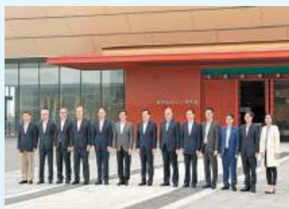
夏寶龍（中）早上到西九文化區考察，並參觀香港故宮文化博物館。

劉兆佳又說，近期香港內部及海外都有唱淡本港及國家經濟金融前景的論調。他說國家不會同意有關言論，更認為是美西方為本港製造問題，唱淡香港以達到打壓目的；中央對於香港發展前景充滿信心。