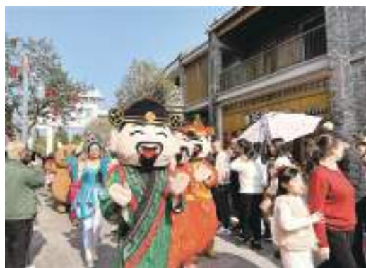
古勞水鄉旅遊區舉行“古勞水鄉中國年”系列主題活動。