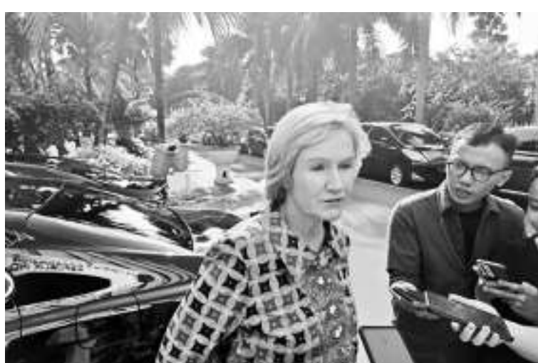
世界银行驻印尼和东帝汶代表丽丝特(Leste Satu Kahkonen)。

【本报讯】2月28日，世界银行驻印度尼西亚和东帝汶代表处处长丽丝特(Leste Satu Kahkonen)评估免费午餐计划必须仔细