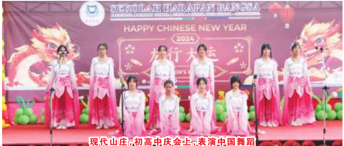
现代山庄,初高中庆会上,表演中国舞蹈