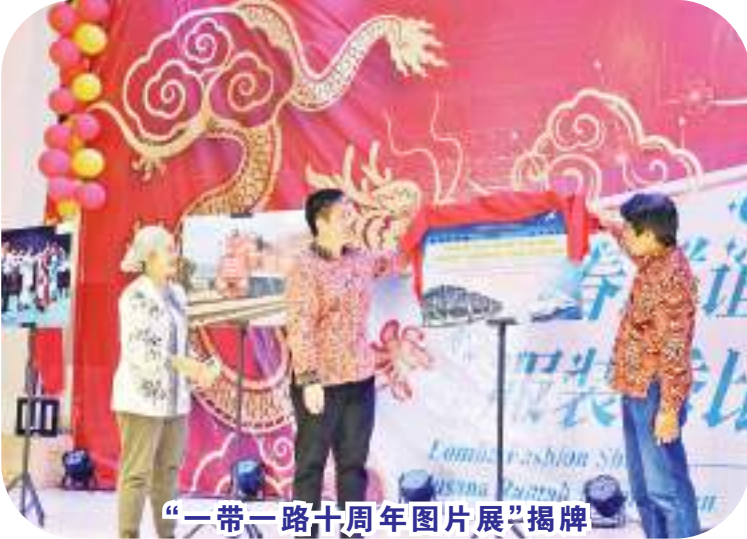
“一带一路十周年图片展”揭牌