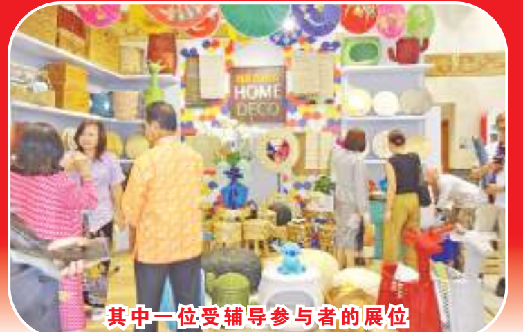
其中一位受辅导参与者的展位

【本报讯】佐科维总统于周三(2024年2月28日)在雅加达中区史纳雅雅加达会议展馆(JCC)视察在2024年国际手工艺品贸易博览会(Inacraft 2024)印尼中小微企业的展位。