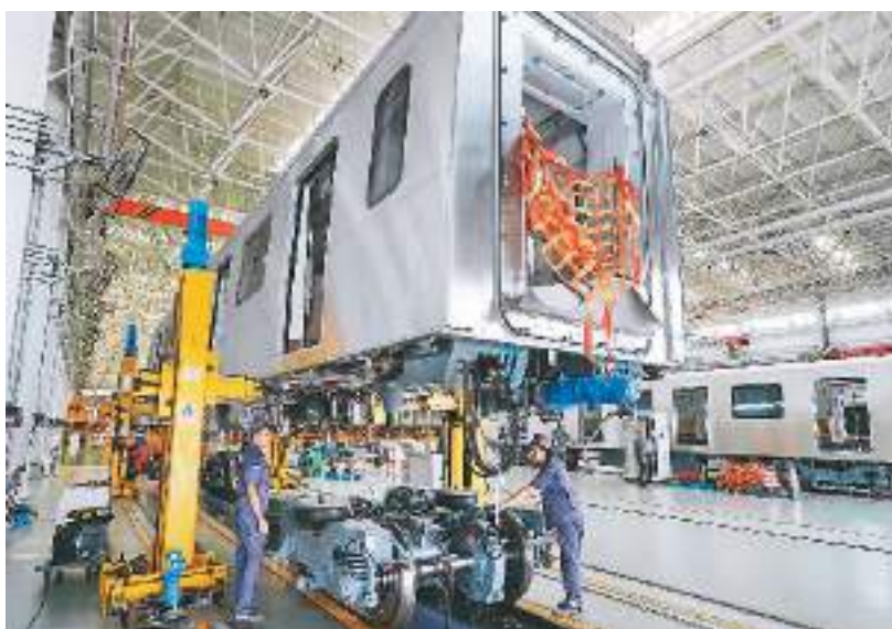
在位于河北省保定市满城区的河北北京车智能生产基地,来自北京的设计图纸,不断变为一系列新的地铁列车并下线投入使用。因为工人在该基地生产车间工作。

绍,十年间,北京经济总量先后跨越3万亿元、4万亿元两个大台阶,人均GDP、劳动生产率、万元GDP能耗水耗等多项指标在全国省级地区一直处于最优水平,走出了一条减量刚性约束下的高质量发展之路。