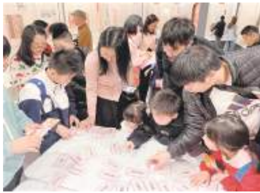
臺山市博物館舉行的翻譯傳統地名遊戲吸引不少人參與。

服務質量是旅遊業作爲現代服務業的內在屬性，是企業的核心競爭力，是衡量行業發展水平的重要指標。爲了把“流量”轉化爲“留量”，我市着力提高住宿體驗，讓遊客留下來。我市品牌酒店、特色精品酒店、網紅民宿