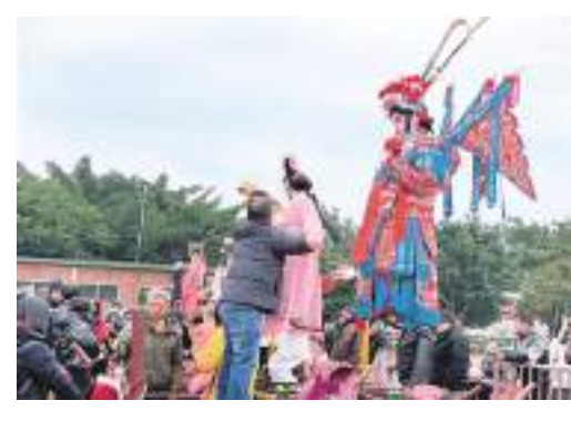
臺山市舉辦浮石飄色巡遊，展示江門非遗之美。

沿着高質量發展之路闊步前行，奔向春天的“灣區江門”，已成爲令人嚮往的“詩和遠方”。願每一個遊客，都帶着歡欣而來，帶着滿足踏上歸途。（李銀換）