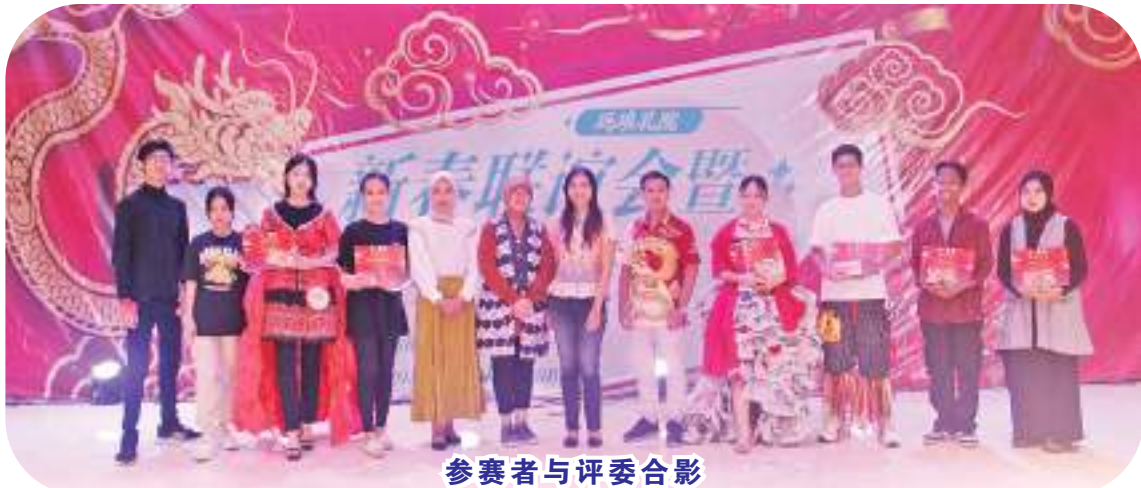
参赛者与评委合影