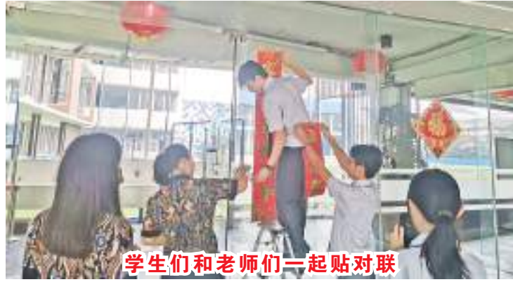
学生们和老师们一起贴对联