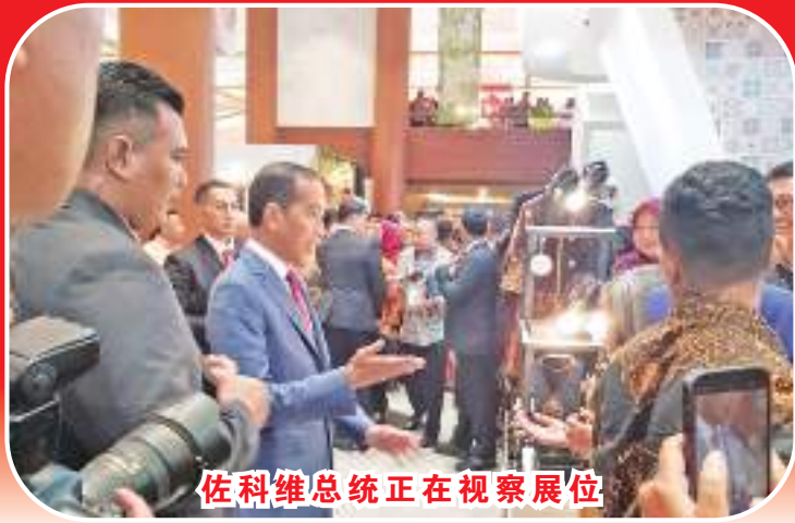
佐科维总统正在视察展位