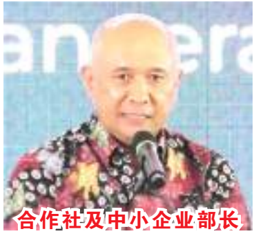
合作社及中小企业部长