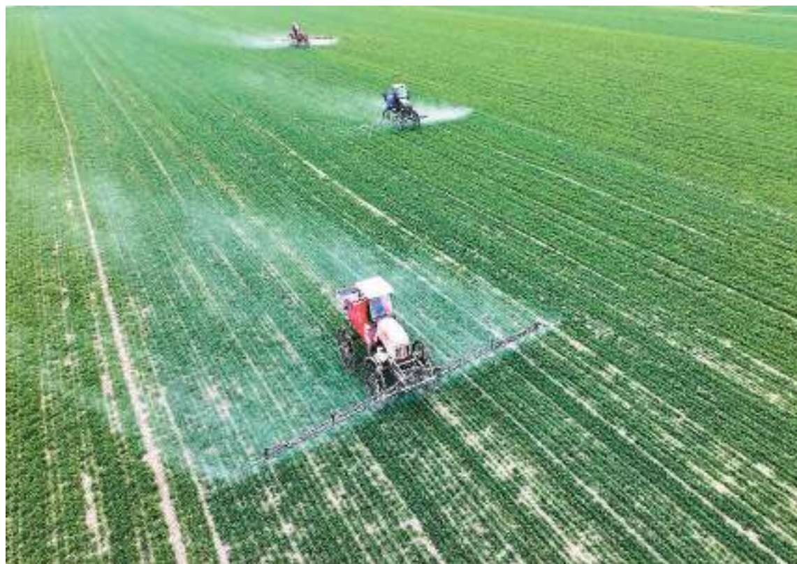
▲2月18日，在安徽省亳州市利辛县纪王场乡孙老家村麦田，农民驾驶自走式高秆喷药机进行田间管护作业。