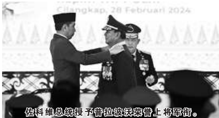
佐科维总统授予普拉波沃荣誉上将军衔。

【本报讯】佐科维总统授予国防部长普拉波沃四星上将荣誉军衔，然而社会舆论褒贬不一。佐科维总统如何回应这些评论？