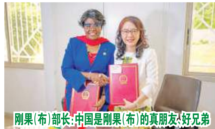
刚果(布)部长:中国是刚果(布)的真朋友、好兄弟

对工程处员工的指控开展独立、公正调查。以色列应为联合国调查提供支持和配合。同时，国际社会应继续支持工程处等人道机构开展工作。中方呼吁国际社会特别是主要捐款国尽快恢复向工程处供资。戴兵援引联合国秘书长古特雷斯的话说，炮火之下的加沙没有开展人道救援的条件。立即实现停火是保护平民、开展救援、缓解人道灾难的必要前提。戴兵表示，这是当前国际社会压倒性的呼声，也是安理会成员压倒性的共识。希望有关国家秉持负责任、建设性态度，支持安理会就要加沙立即停火采取行动。中方将继续同国际社会一道，为恢复和平、拯救生命行动，为平息加沙战火、落实“两国方案”、实现中东持久和平作出不懈努力。